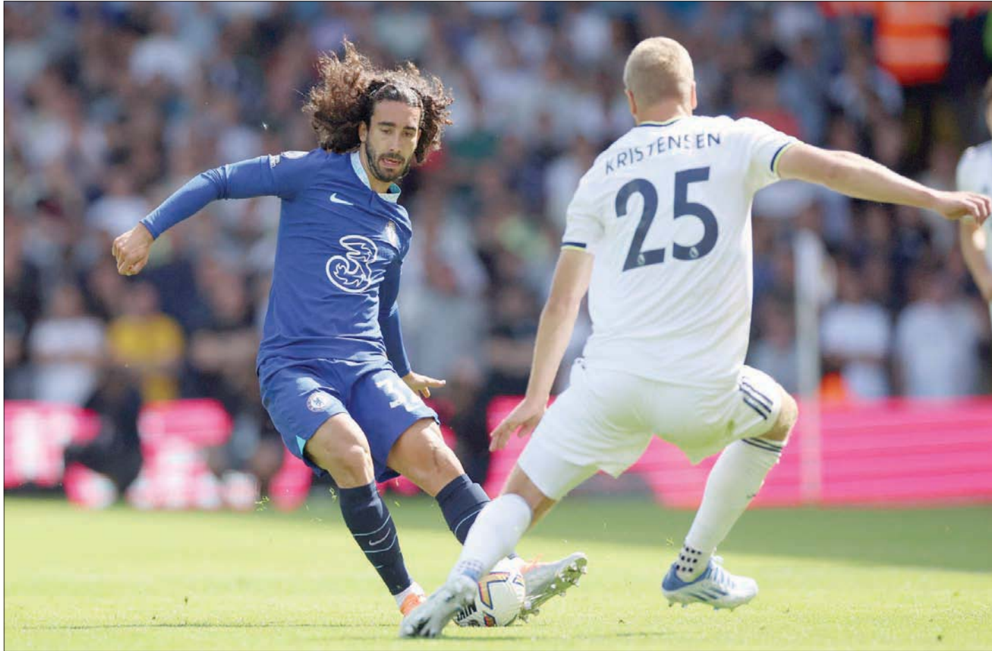
كوكوريلا لم يكن أحد يرغب في التعاقد معه لكنه بات الآن أعلى ظهير في الدوري الإنجليزي