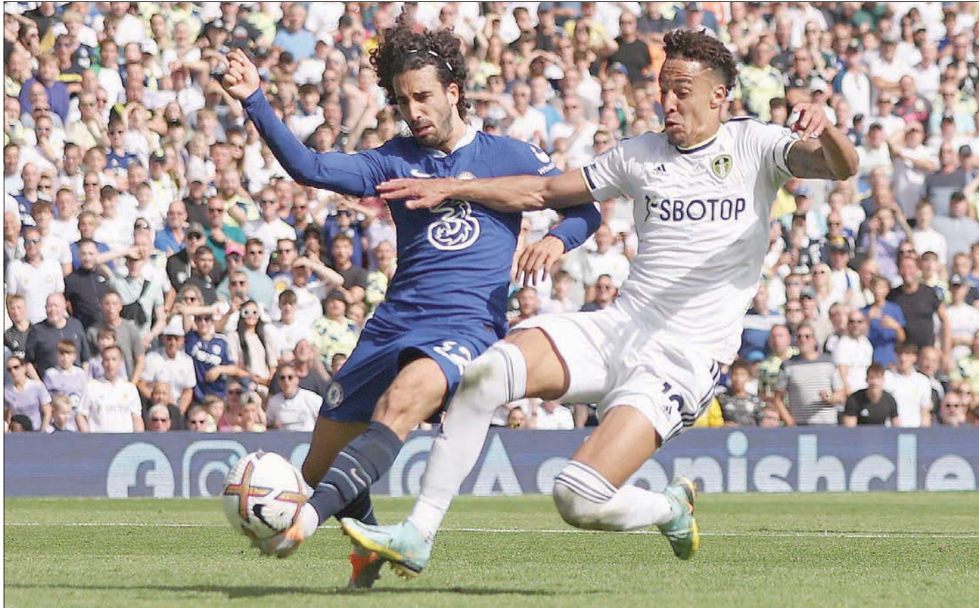
كوكوريلا (يسار) في مباراة ليدز يونايتد الأخيرة