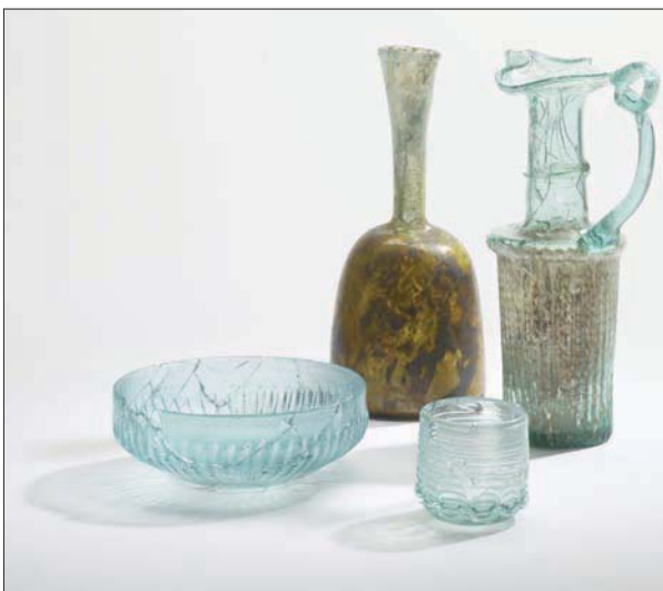
بعض القطع المرممة في معرض «زجاج بيروت المهشم» (المتحف الأركيولوجي في الجامعة الأميركية، بيروت - لبنان)

لها لو لم تنكسر تلك القطع. فعبير عمليات تحليل دقيقة قام بها كل من د. أندرو ميك ود. جوان داير من المتحف البريطاني كان من الممكن سبر أغوار أسرار صناعة وتلوين القطع. عند تكسر القطع برزت في داخل كل كسر جوانب من الزجاج الداخلي كما أثار وجود بعض العناصر الملونة في كل قطعة الاهتمام، خاصة أن القطع الثمانية لم تكن ملونة، مما طرح فكرة أن صناع القطع قاموا بتدوير زجاج مستخدم، وهو ما سيمنح الخبراء الفرصة لتكوين صورة واضحة لصناع ومستخدمي الزجاج في الحقب