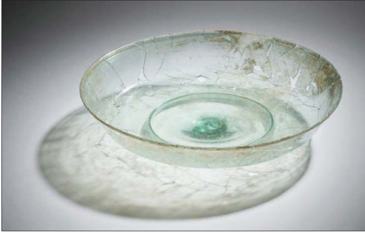
صحن من العصر الروماني بين عامي 200 و 400

ومن جانبه، قال هارتويغ فيشر، مدير المتحف البريطاني: «يروي معرض زجاج بيروت المحطم قصة الدمار والتعافي، والصمود والتعاون. بعد مرور عامين على انفجار بيروت، يسعدنا أن نعرض هذه الأواني الزجاجية القديمة الثمينة المحفوظة. نحن ممنون للعمل المتفاني الذي قام به المرء من المتحف الأثري في الجامعة الأميركية في بيروت والمتحف