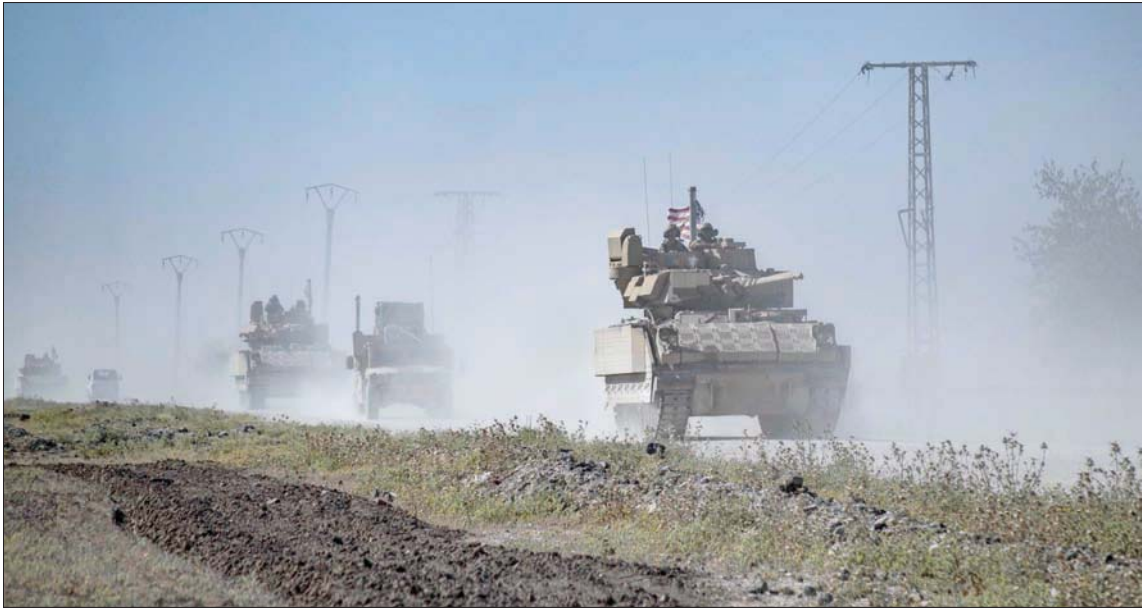
دورية القوات الأميركية قرب حقل الرميلان النفطي شمال شرقي سوريا مايو الماضي

وأضاف كنعاني أن الهجوم الأميركي على البنية التحتية والشعب السوري انتهاك لسيادة سوريا ووحدة أراضيها. المواقع المستهدفة لاصلة لها بالجمهورية الإسلامية».