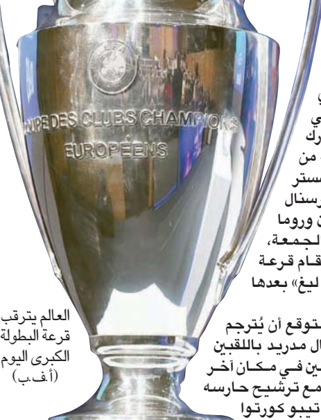
العالم يترقب قرعة البطولة الكبرى اليوم

وكانت مباراة الذهاب انتهت بالتعادل السلبي ليصعد فيكتوريا بلزن فائزاً بمجموع مباراتي الذهاب والإياب 0- 2.