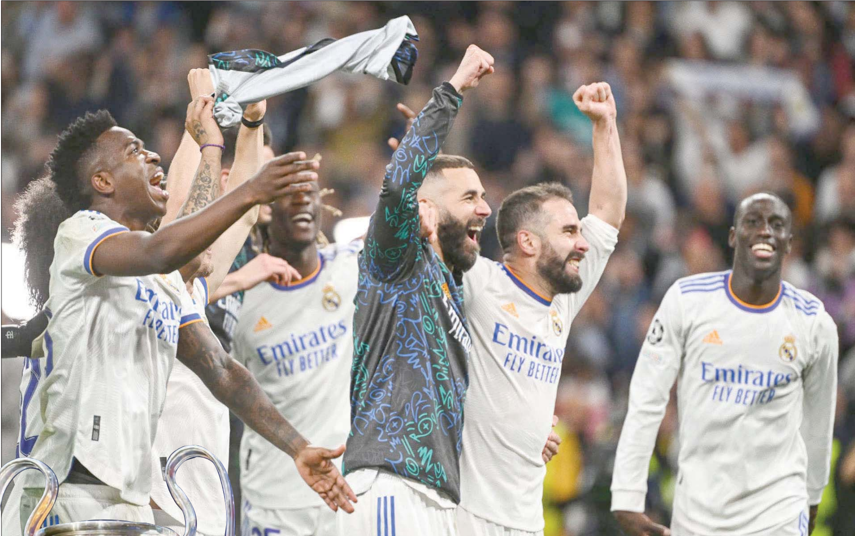
الريال آخر المتوجين بدوري أبطال أوروبا (الشرق الأوسط)

ولن تشارك الأندية الروسية بسبب الحظر المفروض عليها جراء غزو أوكرانيا، لكن الأخيرة ستشارك ببناء واحد