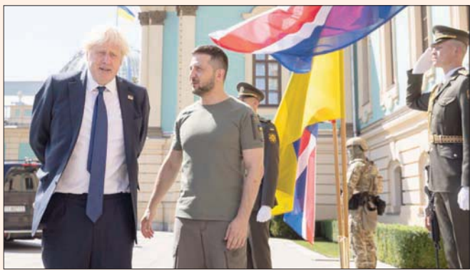
جونسون وزيلينسكي في كييف أمس (د.ب.أ)

بريطانيا وحلفاء أوكرانيا «صفاً واحداً» مع كييف والشعب الأوكراني. وكان قد كتب على موقع «تويت»: «ما يحدث في أوكرانيا يهمني جميعاً. وهذا هو سبب وجودي في كييف. ولهذا السبب ستستمر المملكة المتحدة في دعم أصدقائنا الأوكرانيين». وأضاف: «اعتقد أن أوكرانيا قادرة على الانتصار في هذه الحرب، وستنصر».