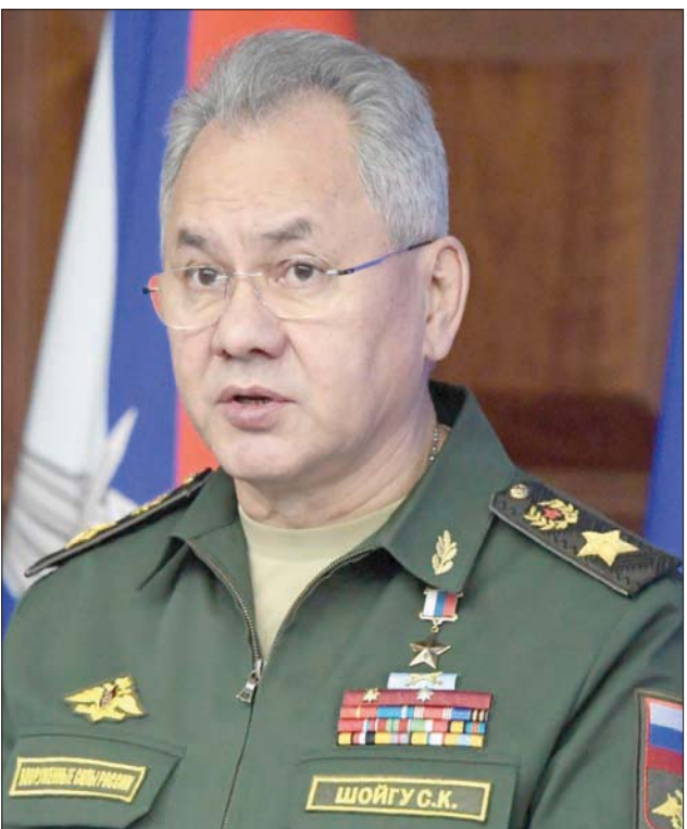
وزير الدفاع الروسي

تعمل على «إقامة حياة سلمية في الأراضي التي جرى تحريرها بينما تستخدم كييف تكتيكات الأرض المحروقة». وفي إشارة ذات مغزى، قال وزير الدفاع الروسي إن «البرنامج البيولوجي العسكري الأمريكي، الذي جرى الكشف عن تفاصيله خلال العملية الخاصة، يشكل تهديداً مباشراً لدول (منظمة شنغهاي للتعاون)». وشدد على أن دور «منظمة شنغهاي للتعاون» بوصفها «مركزاً جديداً للقوة» تنامي بشكل ملحوظ على خلفية الوضع الدولي المضطرب، مؤكداً أهمية استمرار ما وصفه بـ«المسار المستقل» للدول الأعضاء في المنظمة في حل مشكلات الأمن الإقليمي والعالي، بصفتها نموذجاً مهماً للتعاون الإقليمي والدولي.