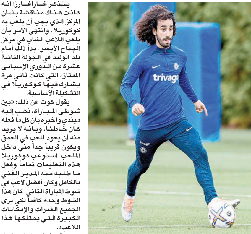
في تدريبات تشيالسي