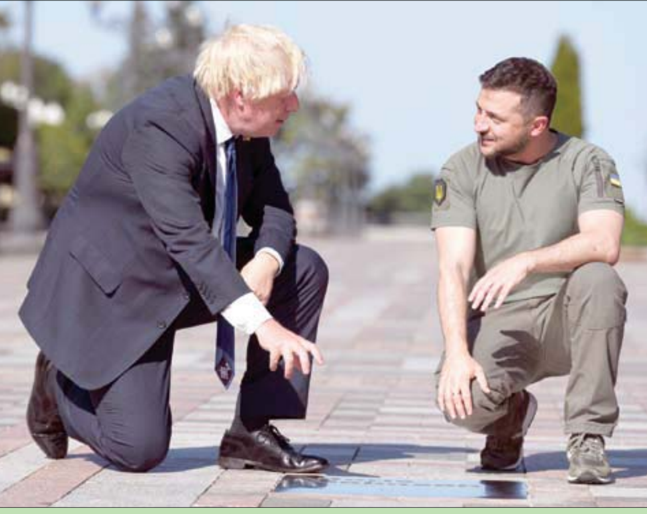
فلوديمير زيلينسكي وبوريس جونسون في كييف أمس