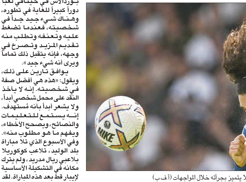
كوكوريلا يتميز بجرأته خلال المواجهات