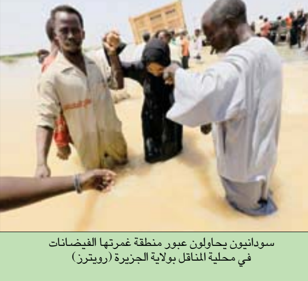
سودانيون يحاولون عبور منطقة غمرتها الفيضانات في محلية المناقل بولاية الجزيرة