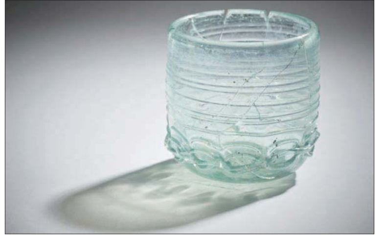
كوب من العصر البيزنطي بين عامي 500 و 700