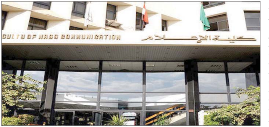
كلية الإعلام في جامعة القاهرة