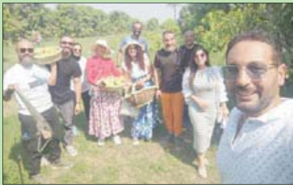
اجتذب المهرجان المصريين والأجانب (الشرق الأوسط)