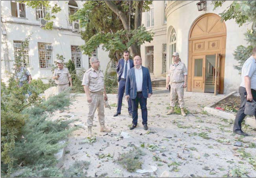
عمدة سيفاستوبول يتفقد موقع انفجار في مقر الأسطول الروسي

طرف سيتمكن من تقديم «قوات مقنعة وحاسمة لشن عمليات هجومية».