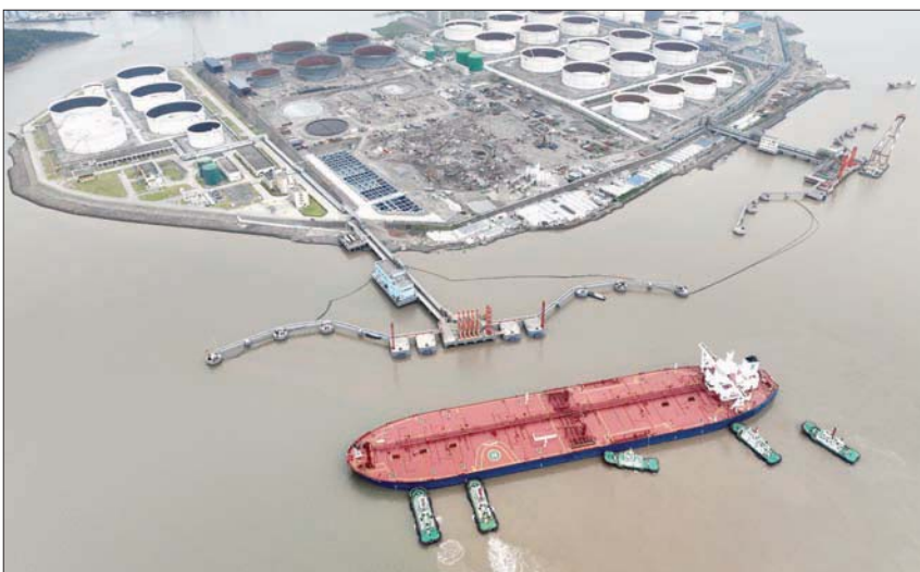
زوارق قطر تساعد ناقلة نפט خام في الرسو على الرصيف في محطة نفط قبالة جزيرة وايدوا في توشوشا بمقاطعة تشينغيانغ الصينية

ريفة تم تجميد عمليات السحب فيها، وذلك في إطار معالجتها لإحدى أكبر الفضائح المصرفية التي تسببت باندلاع احتجاجات شعبية. وتضرر القطاع المصرفي بشدة في المناطق الريفية عقب حملة إجراءات صارمة بدأتها بكين لاحتواء أزمة فقاعة عقارية وديون متصاعدة، وكان لها ارتدادات قوية على ثاني أكبر اقتصاد في العالم. وقامت أربعة مصارف في مقاطعة خنان بتجميد عمليات السحب منتصف أبريل (نيسان) بعد تحرك السلطات للاحقة مخالفات سوء إدارة، ما أدى إلى احتجاز أرصدة مئات الآلاف من