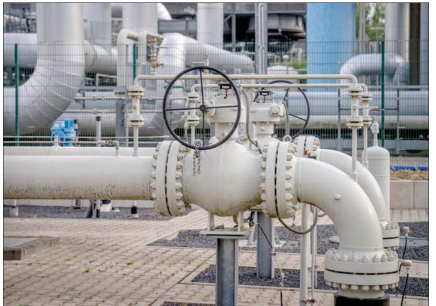
تتاهب برلين لنقص في الإمدادات الروسية للغاز مع اقتراب فصل الشتاء (آب)

وساعة النطاق، بما في ذلك انتقادات من حزبه نفسه. وقال زعيم الكتلة البرلمانية للحزب كريستيان نور لوكالة الأنباء الألمانية: «نجري مباحثات مكثفة بشأن كيفية تجنب أزمة طاقة تلوح في الأفق هذا الشتاء. وكحزب، أعدنا عدداً من الاقتراحات بشأن هذا الأمر. وافتتاح نورد ستريم 2 ليس واحداً منها». كما أشار إلى أن افتتاح خط الأنابيب، الذي كان من المقرر أن تتم المصادقة عليه قبل أيام من غزو روسيا لأوكرانيا في فبراير (شباط)، سيعتد «بإشارة خاطئة إلى شركائنا الأوروبيين». ودعا نور، بدلاً من ذلك، إلى أن يستمر عمل محطات الطاقة النووية الثلاث المتبقية في ألمانيا في الوقت الراهن، لتخفيف الضغط على سوق الطاقة. ومن المقرر أن يتم إغلاق المفاعلات بنهاية العام، في إطار توفيق ألمانيا عن الطاقة النووية.