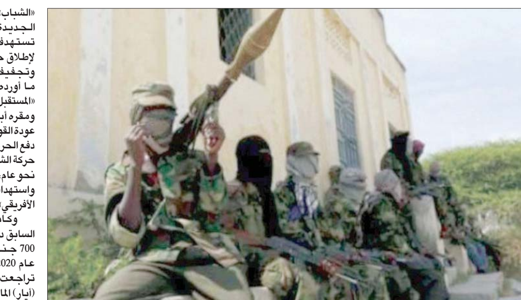
عناصر من حركة «الشباب» الصومالية

لكن توفيق تشير إلى عامل آخر أدى إلى تصعيد هجمات الحركة خلال الفترة الأخيرة، ألا وهو «مقتل زعيم تنظيم القاعدة أمين الطواهري»، وتقول الباحثة في الشأن الأفريقي إن «الشباب