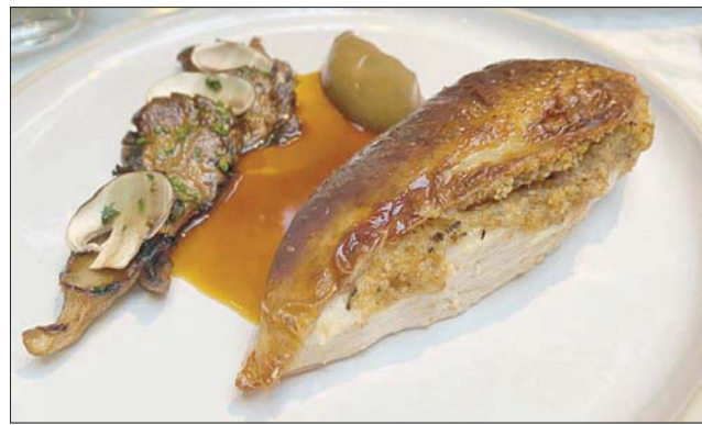
من ألذ أطباق الدجاج المتوفرة في مطاعم لندن