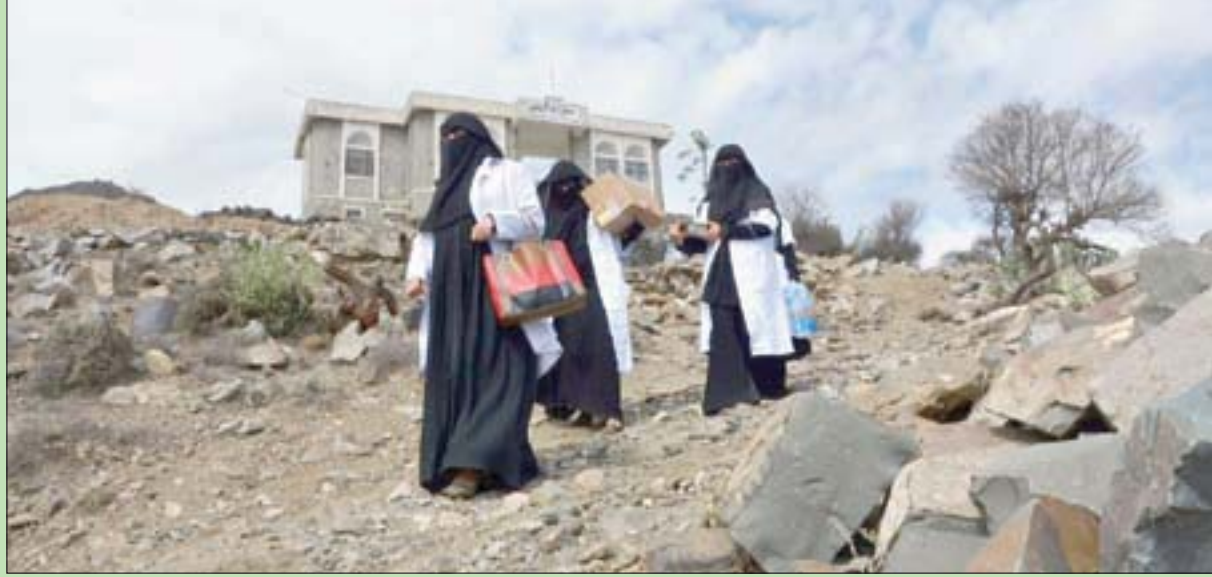
عاملات إغاثة يقدمن المساعدات في إحدى المناطق اليمنية

وإصابة اثنين، واختطاف سبعة، واحتجاز تسعة. كما وقعت 27 حادثة تهديد وتخويف بين يناير (كانون الثاني) ويونيو (حزيران)، مقارنة بـ 17 حادثة من هذا القبيل تم تسجيلها طوال العام الماضي. وأوضح أنه تم تسجيل 28 حادثة اختطاف سيارات في الأشهر الستة الأولى من العام، أي بزيادة 17 حادثة عن عام 2021، وأنه في النصف الثاني من العام الجاري تم تسجيل 27 هجوماً على مبان ومنشآت منظمات إغاثية، بما في ذلك نهب الإمدادات الإنسانية وغيرها من الأصول، وهو أيضاً أكثر مما تم تسجيله طوال العام الماضي. وشكك بيان المنسقة الإنسانية في اليمن من تعرض العاملين في مجال الإغاثة «لحملات تضليلية وتحريضية، بما في ذلك الإدعاءات الكاذبة بأنهم يفسدون قيم الشعب اليمني، بما فيها أخلاق