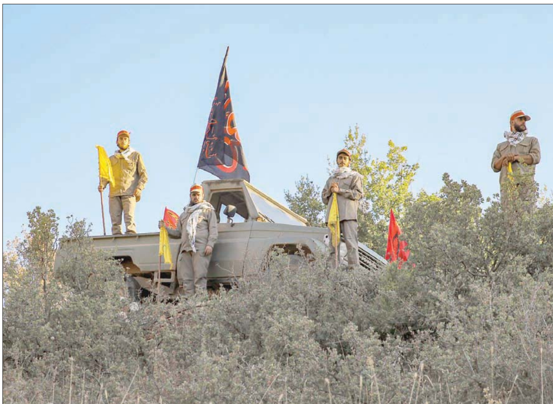
مقاتلون من «حزب الله» في موقع «المعلم السياحي» الذي افتتحه في منطقة البقاع اللبنانية

بيروت، الشرق الأوسط، رفع «حزب الله» وتيرة تهديده برد فعل عسكري ضد إسرائيل، على خلفية ما أسماه «التسوية والمطالعة» في حسم ملف الحدود البحرية معها، ملفاً «ضيق الوقت»، وعازلاً للوفد عن المفاوضات حول الملف النووي الإيراني، في غياب أي خروقات جديدة في مساعي التوصل إلى تسوية.