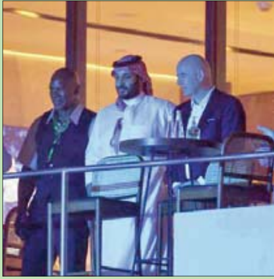
الأمير محمد بن سلمان إلى جانبه رئيس الفيفا جبراني انفانتينو والبطل السابق للوزن الثقيل هوليفيلد

بحضور ولي العهد السعودي الأمير محمد بن سلمان، ونخبة من الشخصيات الرياضية والعالمية يتقدمهم جبراني انفانتينو رئيس الاتحاد الدولي لكرة القدم (الفيفا) ووزير الرياضة السعودي الأمير عبدالعزيز الفيصل، فاز الملاكم الأوكراني أولكسندر أوسيك على البريطاني أنتوني جوشوا، ليحتفظ بألقاب العالم للوزن الثقيل للملاكمة، وذلك في النزال الذي احتضنته صالة الصالة المغفاة في مدينة الملك عبدالله الرياضية بجدة، وأطلق عليه «نزال البحر الأحمر»، وانتهى بعد 12 جولة انقسم