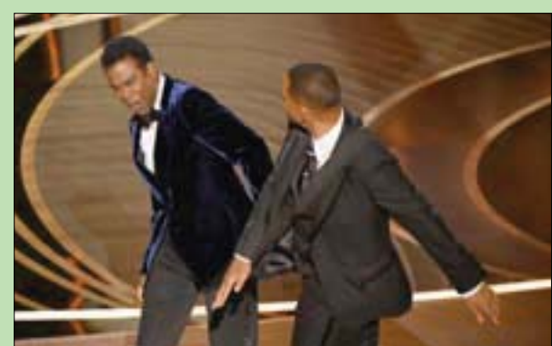
صغ سميث لروك في حفل الأوسكار في 27 مارس الماضي

مارس (أذار) الماضي. ووفقاً لـ «فاري تي في أي بي»، فإن البيانات الجديدة - مقياس الصناعة لتحديد مستوى الجاذبية عند الجماهير - كشفت أن سمعة ويل سميث تضررت بدرجة كبيرة. ويظهر الاستطلاع الذي يتم إجراؤه مرتين في العام في يناير (كانون الثاني) وفي يوليو (تموز) أن سمعة ويل سميث تضررت بدرجة كبيرة. ويظهر الاستطلاع الذي يتم إجراؤه مرتين في العام في يناير (كانون الثاني) وفي يوليو (تموز) أن سمعة ويل سميث تضررت بدرجة كبيرة. ويظهر الاستطلاع الذي يتم إجراؤه مرتين في العام في يناير (كانون الثاني) وفي يوليو (تموز) أن سمعة ويل سميث تضررت بدرجة كبيرة.