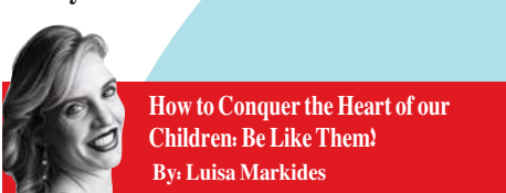
How to Conquer the Heart of our Children Be Like Them By: Luisa Markides