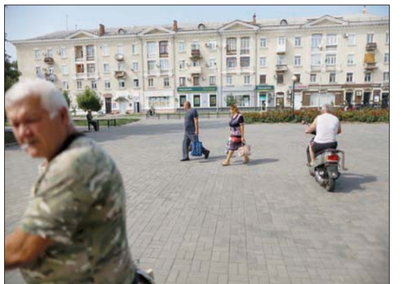
منطقة باخموت في شرق أوكرانيا

في ذلك بالعملة الأجنبية، قابلة للمعالجة». لكن «إس أند بي» قالت إن القرار يأتي بناء على فرضية مواصلة الولايات المتحدة والاتحاد الأوروبي تمويل كييف في الأشهر المقبلة. ويؤكد اتفاق مع صندوق النقد الدولي بشأن إعفاء لمدة عامين الأسبوع الماضي من تسديد ديونها الخارجية.