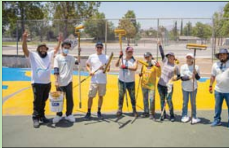
انتهى الفريق من طلاء مليون قدم مربع في منطقة باكويا