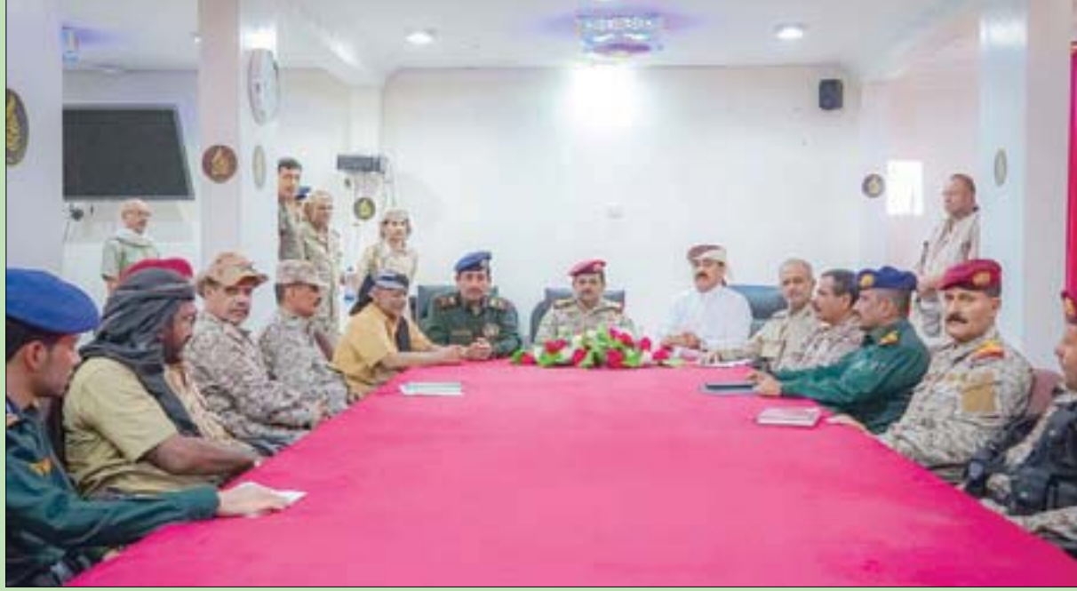
جانب من اجتماعات اللجنة الرئاسية العسكرية اليمنية لتثبيت الأمن في محافظة شبوة

سلامة المسافرين والحركة التجارية في هذا الخط. وشددت اللجنة الرئاسية على «ضرورة جبر الضرر وحصر الأضرار البشرية والمادية الخاصة والعامة واعتبار كل من سقط في هذه الأحداث شهداء ومعالجة جميع الجرحى قبل أن يتدخل مجلس القيادة لتلك الأحداث المؤسفة»، وأكدت أهمية تشكيل لجنة لمناجاة ومراقبة تنفيذ الإجراءات التي أمرت بها. ودعت اللجنة العسكرية والأمنية إلى «الالتزام بتنفيذ جميع الإجراءات الصادرة عنها»، وحذرت «كل من يسعى للإخلال أو التقصير في تنفيذها، مع التأكيد على أهمية التحلي بالضبط والربط العسكري وفقاً للأنظمة واللوائح العسكرية والأمنية.» وشهدت مدينة عقن مواجهات بين قوات أمنية وعسكرية خلفت قتلى وجرحى، الرئيس بإصدار قرارات طاحت بالقيادة المشاركين في المواجهات مع تشكيل لجنة برئاسة وزير الدفاع للتحقيق وتثبيت الأمن في المحافظة.