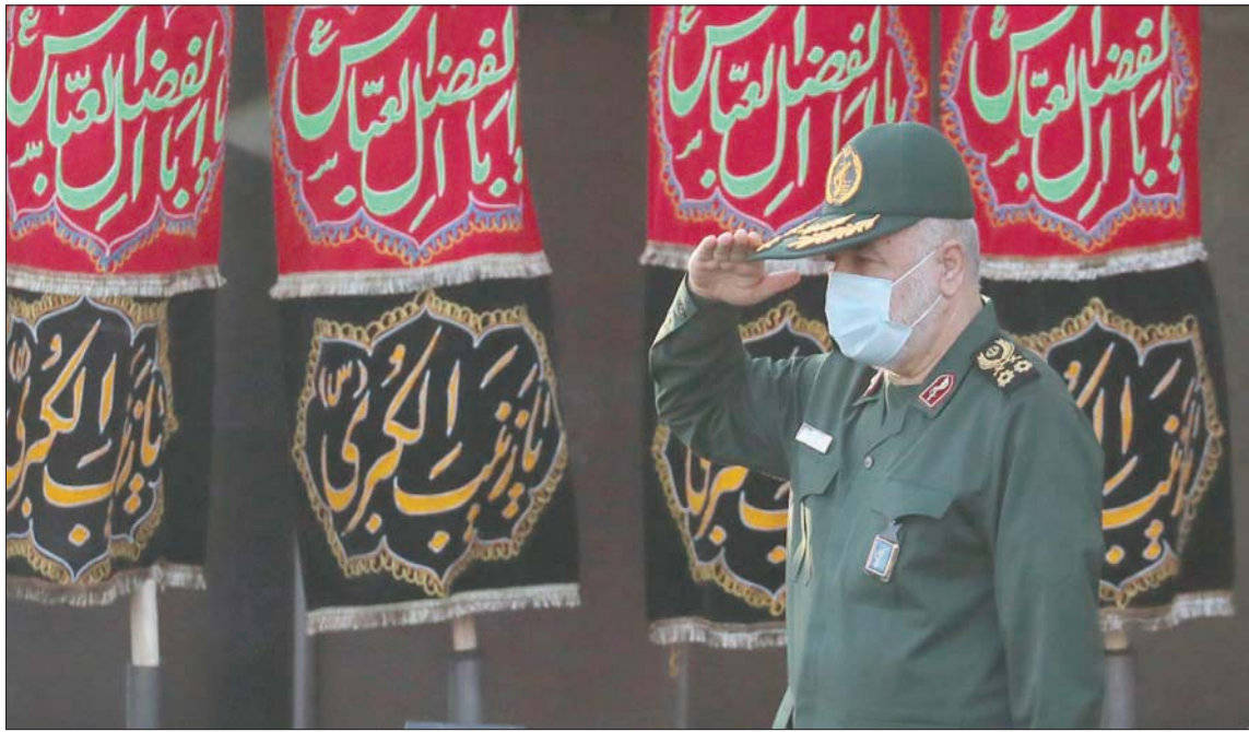
قائد «الحرس الثوري» الإيراني حسين سلامي

بايدن من هذه القضايا ثابت لم يتغير، وهو أنه لا يزال يتعين على إيران أن توضح للوكالة الدولية للطاقة الذرية سبب العثور على آثار مواد نووية من اليورانيوم - غير مُعلن عنها - في مواقع إيرانية عام 2019، كما أوضحت الولايات المتحدة إيران أنها لا تستطيع إلزام الإدارات الأميركية القادمة بالاتفاق، أو الوعد بسداد تعويضات في حالة انسحاب رئيس الولايات المتحدة القادم من الاتفاق. ويصر الرئيس بايدن، منذ شهر، على أنه لن يرفع تصنيف «الحرس الثوري» كمنظمة إرهابية من أجل إحياء الاتفاق النووي، المعروف باسم «خطة