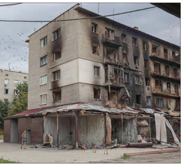
آثار القصف على حي سكني بدونيتسك أمس

في سياق آخر، أصيب تسعة أوكرانيين بينهم أربعة أطفال، السبت، في قصف روسي على مدينة فوزنييسينسك القريبة من محطة نووية في منطقة ميكولايف جنوب البلاد، وفق ما أكد حاكم المنطقة فيتالي كيم، كما نقلت وكالة الصحافة الفرنسية. وكتب كيم على تطبيق تلغرام أن الأطفال تراوح أعمارهم بين ثلاثة وسبعة عشر