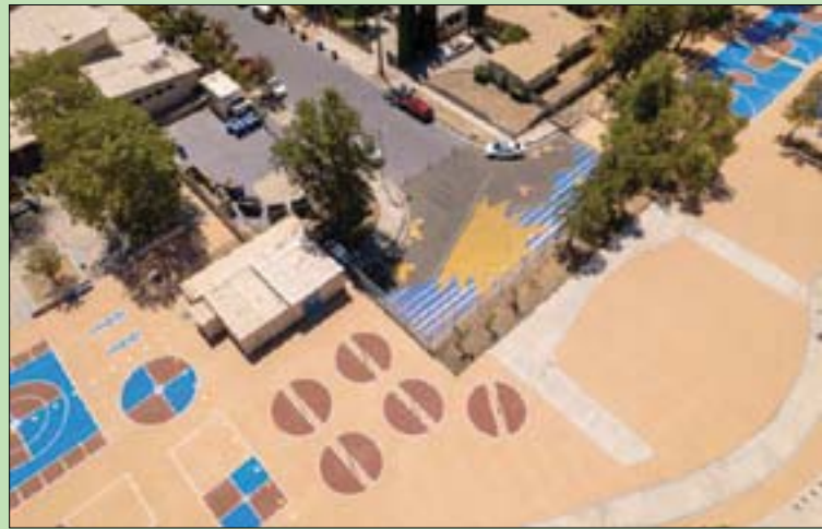
يُستخدم الطلاء مع إضافات تعكس ضوء الأشعة تحت الحمراء