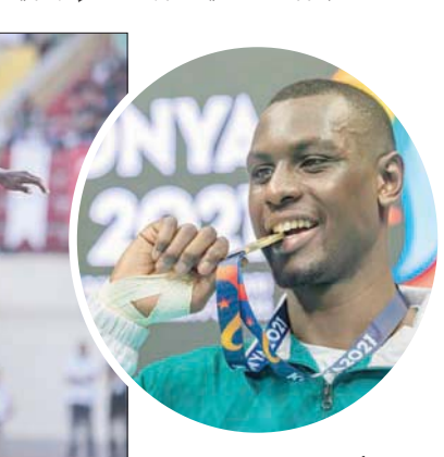
منتخب كرة القدم خسر نهائي البطولة أمام المنتخب تركيا