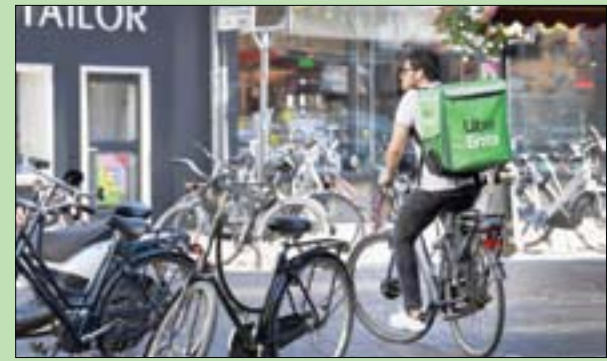
عدد الدراجات المنتجة عام 2015 أكثر من 123 مليوناً

نوعية الهواء الذي نتنفسه. وقال واضع الدراسة الرئيسي الأستاذ في قسم التكنولوجيا الخضراء في جامعة جنوب الدنمارك غانغ ليو، لو كانت الصحافة الفرنسية الفاعلة الرئيسية للدراسة هو أنها تظهر أن الدراجة الهوائية يمكن أن تلعب دوراً مهماً في الحد من بصمات الكربون للنقل، في حين أن الجدل القائم حالياً يركز بالأحرى على الانتقال إلى السيارات الكهربائية.