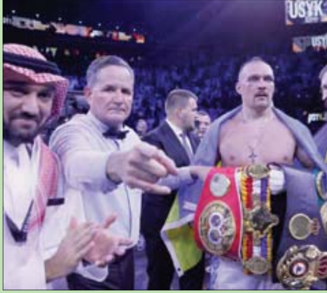
أوسيك محتفلاً بلقبه العالمي في الملاكمة وبيدو الأمير عبدالعزيز الفيصل وزير الرياضة