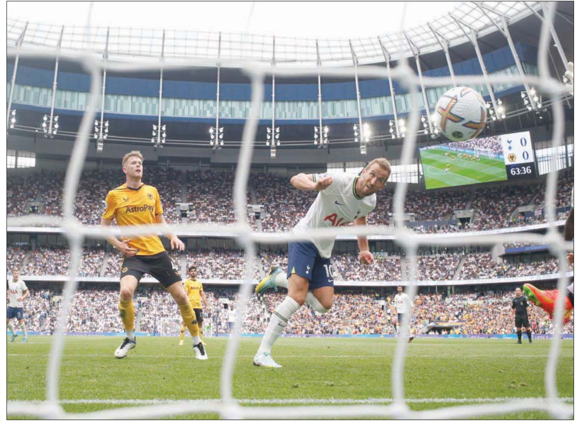
رأسية كين قادت توتنهام للفوز على ولفرهامبتون

الضيوف بدوا أنهم سيحرقون فرحة أصحاب الأرض بهدفي الدنماركي كريستيان نورغارد (44) وإيغان توني (71) قبل أن يمنح ميتروفيتش فولهام فوزه الأول.