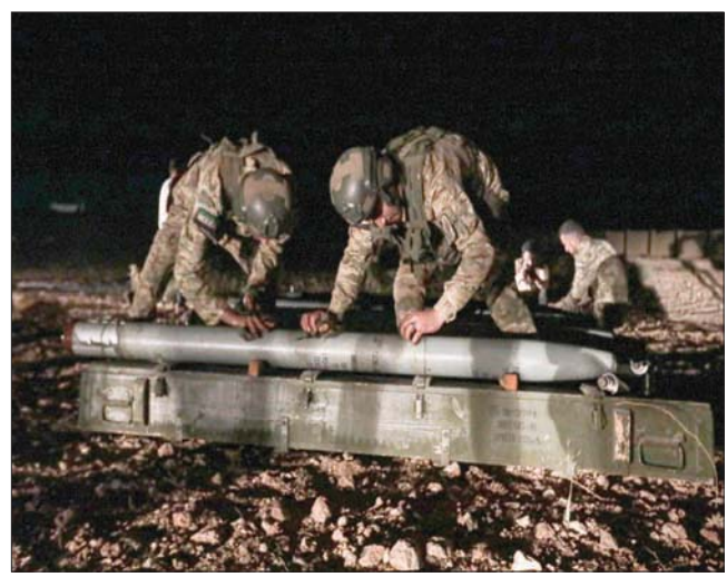
عناصر من «الجيش الوطني السوري» المدعوم من أنقرة خلال إطلاق صواريخ في اتجاه مواقع قوات النظام رداً على «مجزرة الباب» (د.ب.أ) (أ.ف.ب)

بريف حلب الشمالي، بحسب «المرصد» في الوقت ذاته، وصلت القوات التركية والفصائل استهدافها لمواقع الحدود السورية - التركية، حيث استهدفت المدفعية التركية بالقذائف مزارع تعود ملكيتها للأهالي في قرية قربان غرب الدرياسة، بالتزامن مع استهداف مسيرة تركية لمنطقة فارغة بالقرب من المدرسة في الحي الغربي للمدينة. في غضون ذلك، أعلنت وزارة الدفاع التركية عن «تحديد» 11 من عناصر «وحدات حماية الشعب» الكردية، أكبر مكونات «قسد»، مشيرة، في بيان، إلى أن قواتها الخاصة نفذت عملية استعدادهم لتنفيذ هجوم على منطقة عملية «درع الفرات» لزراعة الأمن والاستقرار فيها. سياسياً، اعتبر نائب رئيس حزب العدالة والتنمية الحاكم في تركيا، نعمان كورتولوش، أن بلاده ليست