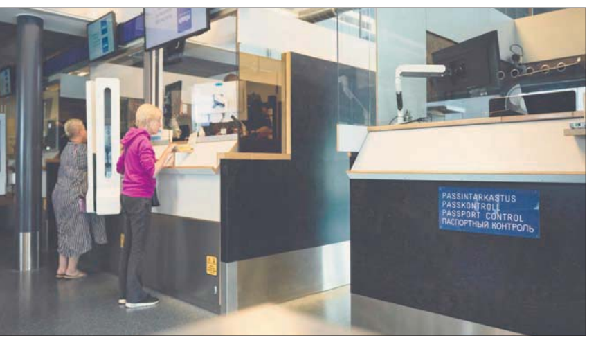
سياح روس في معبر حدودي مع فنلندا

ويتعارض مع الخط الذي تتبعه الدول الـ27 حتى الآن على صعيد العقوبات، ومن المقرر أن يناقش هذا الموضوع خلال اجتماع يعقده وزراء خارجية التحالف في نهاية أغسطس