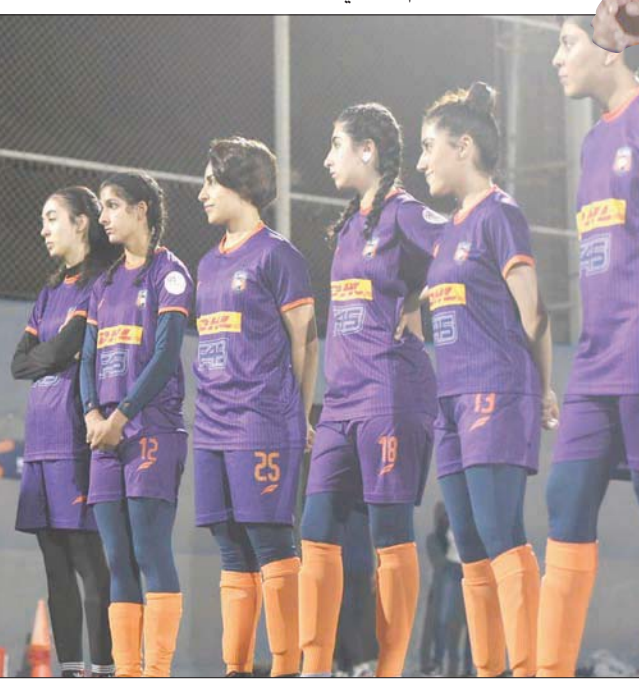
لاعبات شعلة الشرقية يستمعن لتوجيهات الجهاز الفني قبل إحدى المباريات

المستويات الفنية عن قرب، وقد رشحت الفرق التي شاركت في النسخة الأولى بناء على الإمكانيات الفنية حسب ما شاهدته ميدانياً. وبكل تأكيد الدوري القوي سينتج منتخباتاً قوياً.