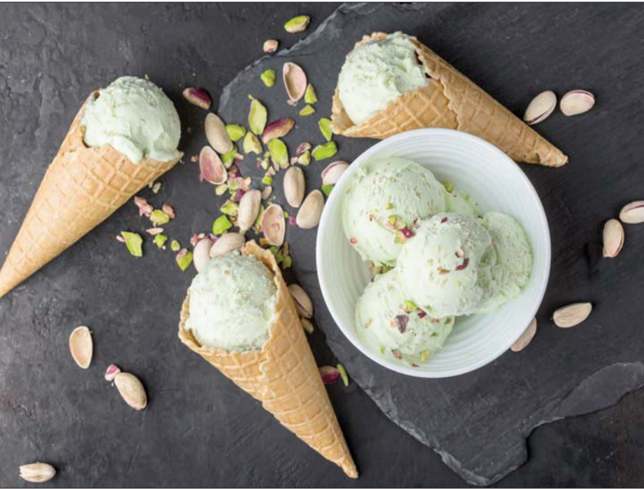
نكهة الفستق لأصحاب الذوق الرفيع

الفستق «مفتاح مذاق (آيس كريم الفستق) الجيد هو التأكد من أنه يمنحك مذاقاً مختلفاً