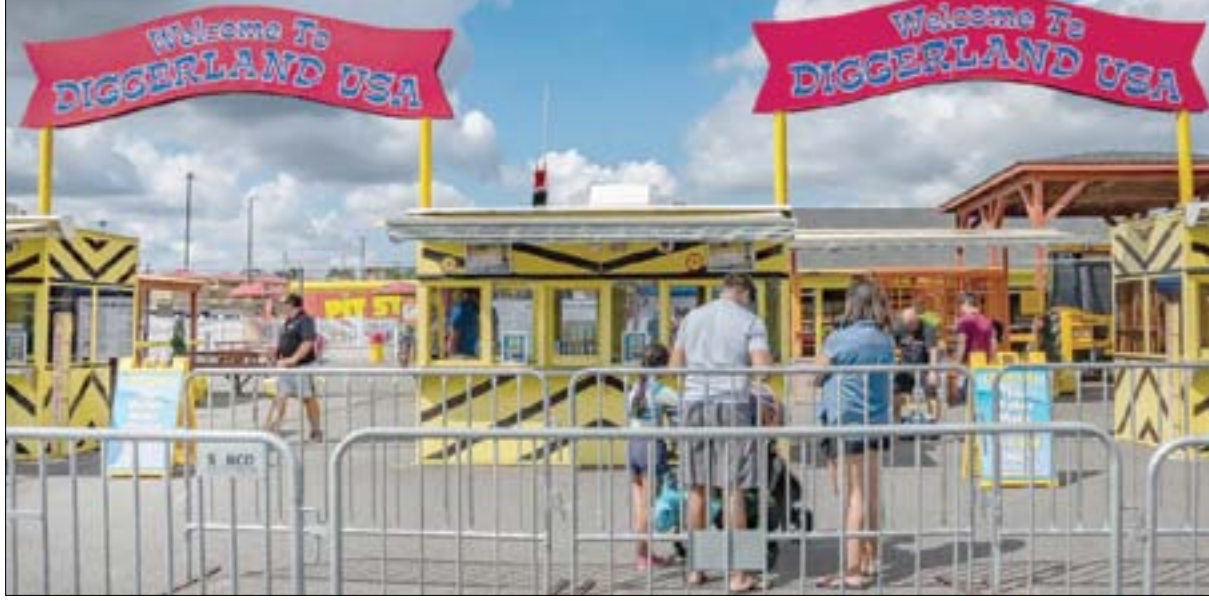
تتيح «ديغرفلاند» للأطفال تشغيل الآلات الثقيلة بمفردهم