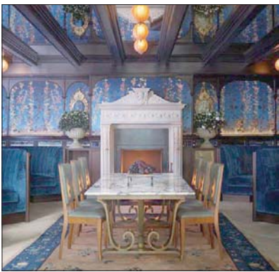
هذه الصالة كانت في الماضي تستخدم زنازئة للموقوفين في مركز بو للشرطة الأقدم في لندن