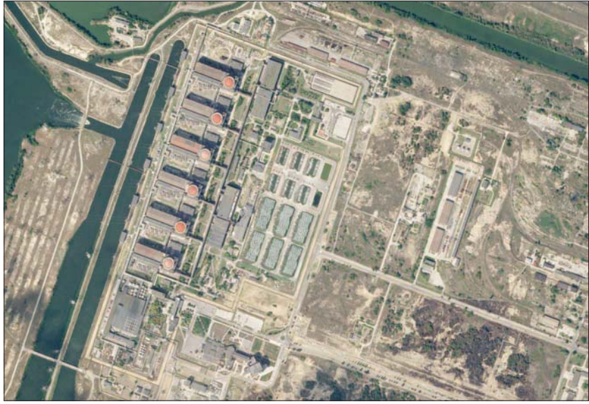
صورة جوية لمحطة زابورجيا النووية

وأضاف المسؤول الذي طلب عدم كشف هويته: «تروى نقصاً تاماً وكاملاً في التقدم الروسي في