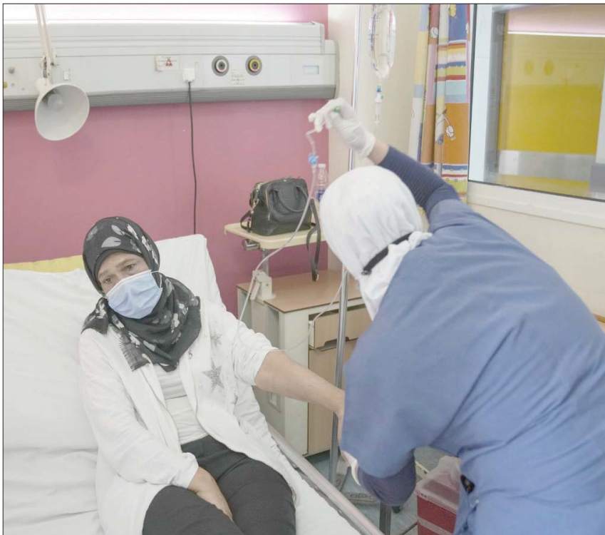
مریضة بالسرطان تتلقى العلاج الكيميائي في مستشفى رفيق الحريري في بيروت

وفي ظل الأزمة، أعلن وزير الصحة العامة فراس الأبيض قبل بيان، أن لجنة تحقيق شكلها قبل أيام ومؤلفة من مفتش إداري وعدد من المعنيين في دائرة التفتيش الصيدلي واللجنة الطبية لأدوية السرطان ودايرة المعلوماتية في وزارة الصحة العامة «تواصل التحقيق بالمعلومات التي تم تداولها عبر وسائل الإعلام حول فقدان أدوية أمراض سرطانية بعد فترة قصيرة من تسليمها لمستودعات وزارة الصحة العامة». لافتاً إلى أن اللجنة «ستقوم في فترة أسبوعين بالتدقيق والتحقق مع المعنيين كافة للتثبت من حصول مخالفات وتحديد المسؤوليات في حال وجدت».