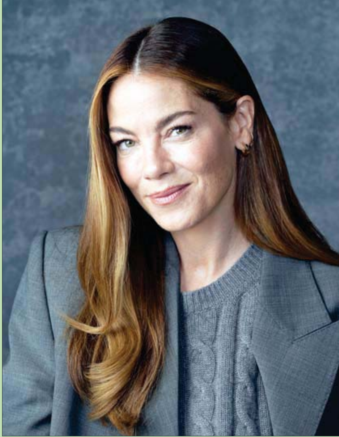
المثلة الأمريكية ميشيل مونغان شاركت في الترويج لمسلسل «أصداء» في لوس أنجلوس