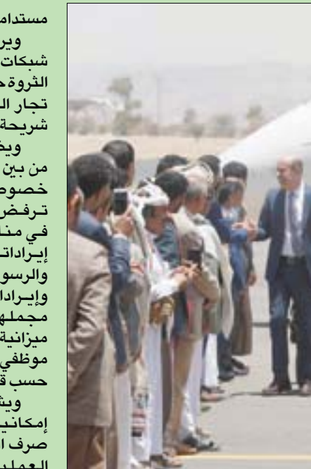
المبعوث الأممي لليمن لدى وصوله في رحلة سابقة إلى مطار صنعاء، في يونيو 2022

إلى تراجع الحكومة في أوقات سابقة عن صرف رواتب قطاعات كثيرة في مناطق سيطرة الميليشيات. وإلى جانب التساؤل عن كمية الوقت التي قد يحتاج إليها غرونديبرغ للتوصل إلى اتفاق بشأن هذا الملف، تبدو نقطة توسيع وجهات السفر من مطار صنعاء إلى وجهات أكثر، عنصراً ملغوماً، بخاصة إذا ما طلب الحوثيون التوسع إلى طهران وبغداد ودمشق وبيروت حيث البؤر التي توجد فيها أذرع المشروع الإيراني في المنطقة، وهي نقطة حساسة بالنسبة للشرعية اليمنية وحتى لدول الإقليم. وكان المبعوث الأممي قد أعلن خلال إحاطته الأخيرة أمام مجلس الأمن أنه يعمل على توسيع الهدنة، من خلال أربعة عناصر تشمل: الاتفاق على آلية شفافة وفعالة لصرف منتظم لرواتب موظفي الخدمة المدنية ومعاشات المتقاعدين المدنيين، وفتح طرق إضافية في تعز ومحافظة أخرى، وإضافة المزيد من الوجهات من وإلى مطار صنعاء الدولي، وانتظام تدفق الوقود إلى جميع موانئ الحديدة.