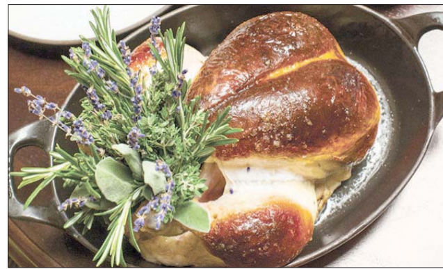
الدجاجة قبل تقطيعها

بسر نحو 90 جنينها إسترلينياً (لشخصين). مضت فترة الانتظار، وجاء النادل وهو يحمل في يده بيضة منزوعة الراس وموضوعة على قاعدة من الحديد على شكل أرجل الدجاجة، سألني: «من جاء قبل البيضة أم الدجاجة؟»، جاوبته: «الآن وفي هذه الحالة البيضة، لأنني ما زلت بانتظار الدجاجة»، البيضة عبارة عن جبن ذاتب مع صلصة الفطر موضوع داخل قشرة البيض، وذهب ليحضر الدجاجة، وذهب ليحضر الدجاجة، وكانت موضوعة في وعاء من الفضة، وزينت بالأعشاب الطبيعية والخزامى، أحضرها لآلتي عليها نظرة قبل أخذها إلى المطبخ مرة أخرى لتقطيعها وإعادتها إلى الطاولة مع الصلصة الخاصة التي تُضاف إليها.