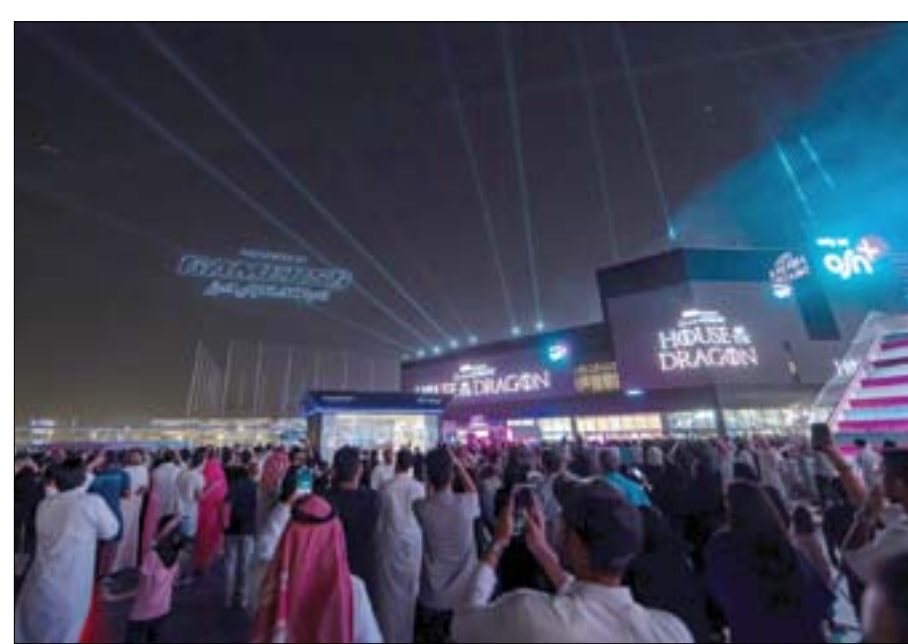
العرض التشويقي في «بوليفارد الرياض»