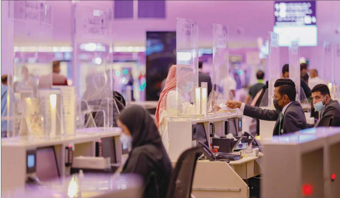
تطوير البنية التحتية لقطاع الطيران دفع لحركة نشطة على السفر في المطارات السعودية