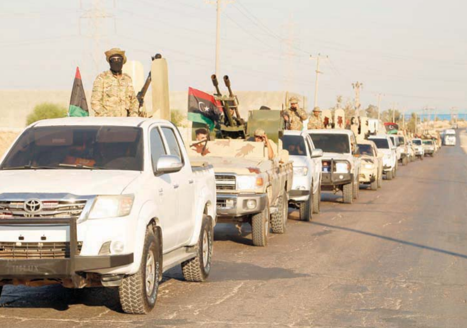
جانب من تحشيدات القوات الموالية لحكومة باشاغا في مصراتة

إلى ذلك، أعلن مركز سبها الطبي مقتل طفل وإصابة شخصين من عائلة واحدة بإصابات خطيرة، بسبب انفجار قذيفة مساء أول من أمس، أمام منزل في محلة الجديد بمدينة سبها بجنوب البلاد. كما أفاد مستشفى طرابلس الجامعي في حادث آخر، بوفاة خمسة أطفال من عائلة واحدة، جراء إصابتهم باحترق بسبب اشتياق ميود حشري، فيما أعلن مركز الزاوية الطبي إصابة 60 بحالة تسمم جراء تلوث غذائي بأحد مطاعم المدينة.