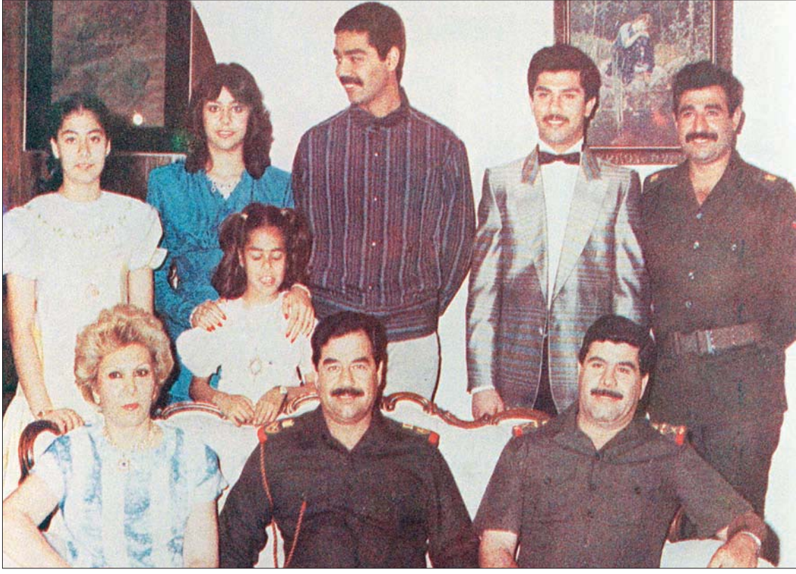
صدام وأفراد عائلته (إلى يساره عدنان خيرالله أخو زوجته ساجدة)، وفي الصف الثاني (يمين) حسين كامل زوج ابنته رغد

مرحلة الانتفاضة ضد حكم الرئيس السابق صدام حسين، إثر خروجه مهزوماً من حرب تحرير الكويت، متهماً الإيرانيين بـ«الغدر» بالعراقيين بعدما وعدوهم بالوقوف إلى جانبهم إذا هاجمهم أميركا، فإذا بهم يدعمون الثورة ضد حكم الرئيس العراقي. ويتناول الراوي