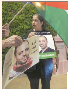
مظاهرون يرفعون العلم الفلسطيني

على الحركة أو الحديث ومستمر بإضرابه، مشيرة إلى أن أمن مستشفى «أساف هروفيه» منعه من الدخول إلى غرفته. وأضافت: «مطلبنا هو الإفراج الفوري عنه وليس التجميد».