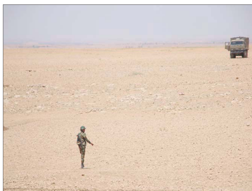
انتشار قوات الجيش السوري في مناطق سيطرة القوات الكردية في مدينة عين العرب (كوباني) بريف حلب الشرقي في 10 أغسطس الجاري

برزت ثلاثة تطورات ميدانية في المناطق الخاضعة لنفوذ «قوات سوريا الديمقراطية» (قسد) شمال شرقي سوريا خلال أسبوع، قد تزيد من تعقيد المشهد العسكري في هذه المنطقة المضطربة والمهددة باجتياح تركي. أول هذه التطورات قصف مسيرة تركية أول من أمس (الجمعة) مركزاً تابعاً للأمم المتحدة في محيط قاعدة التحالف الدولي غرب محافظة الحسكة على بعد نحو 45 كيلومتراً جنوب الحدود التركية.