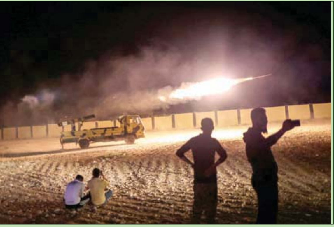
مقاتلون في «الجيش الوطني السوري» المدعوم من تركيا يطلقون من منطقة شمال شرقي حلب صاروخاً صوب مواقع النظام الليلية قبل الماضية