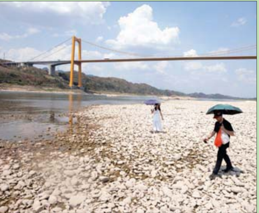
زوجان صينيان يمشيان فوق قاع نهر يانغتسي الناصب في تشونغكينغ أمس وسط انتشار ظاهرة الجفاف عالمياً بسبب التغير المناخي

وأفادت تقارير بوقوع انفجارين: الأول نجم عن انتحاري فجر نفسه خلال الهجوم على الفندق مع مسلحين آخرين، والثاني وقع خارج الفندق بعد وضع دافق من الانفجار الأول، ما أدى إلى سقوط ضحايا في صفوف عمال الإغاثة وعناصر القوات الأمنية والمدنيين الذين هرعوا إلى المكان إثر الانفجار الأول. (تفاصيل ص 3)