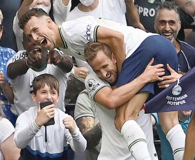
كين يحتفل بهدفه التاريخي أمس

وتحدثت الصحف أن الصفقة بلغت نحو 70 مليون يورو، مشيرة إلى أن ابن الـ30 عاماً سيقع عقداً لمدة أربع سنوات مع إمكانية إضافة سنة أخرى بعد خضوعه للفحص الطبي. ويملك كاسيميرو خبرة كبيرة بعد تتويجه بطلاً لدوري أبطال أوروبا خمس مرات، بالإضافة إلى كونه أحد ركائز منتخب البرازيل على مدى السنوات الأخيرة. ولا يزال فريق «الشياطين الحمر» يحاول تعزيز صفوفه، لا سيما في الجبهة الأمامية وتحدثت الصحف عن إمكانية ضم البلجيكي يانك كاراسكو من أتلتيكو مدريد الإسباني، أو الجناح الهولندي كودي غاكبو من أيندهوفن أو الجناح البرازيلي أنتوني من أياكس الهولندي، مع إمكانية التعاقد مع مهاجم تشيلسي الأمريكي الدولي كريستيان بوليسيك على سبيل الإعارة. واستهل يوناييتد السدوري الإنجليزي الممتاز بأسوأ طريقة ممكنة بخسارته مباراته الأولى أمام برايتون 1 - 2 على أرضه وضد برنتفورد صفر - 4 بعيداً عن قواعد ليحتل المركز الأخير للمرة الأولى منذ عام 1992.