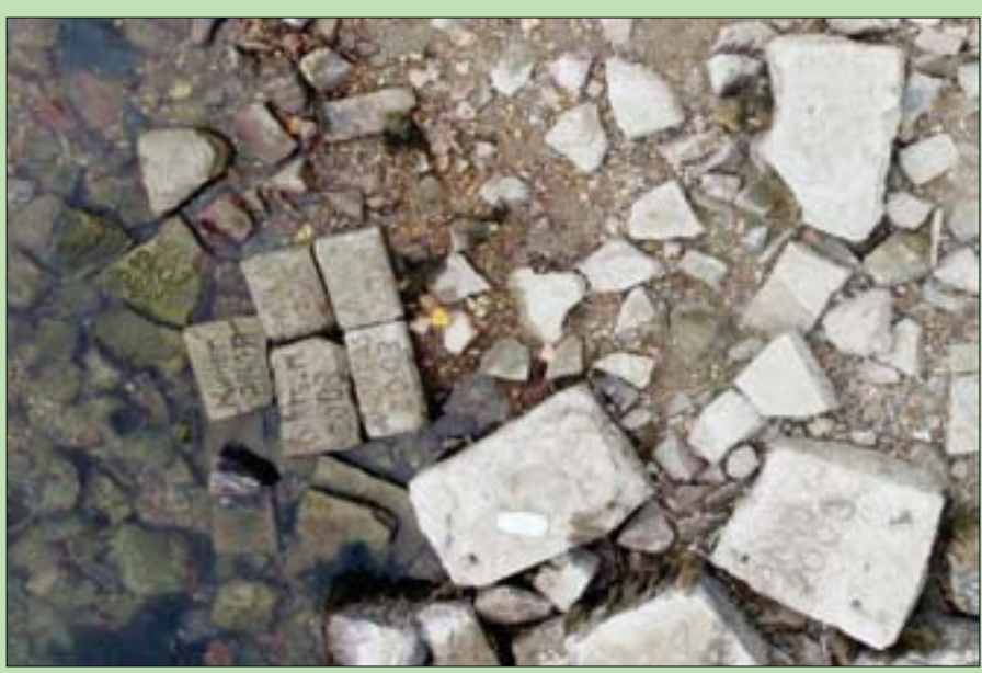
بعض الأحجار القديمة التي كشف عنها انخفاض منسوب نهر الراين الألماني

من سعة الخزان. واكتشف عالم الآثار الألماني هوغو أوبرماير الدائرة الحجرية في عام 1926؛ لكن المنطقة عُمرت في عام 1963 في مشروع تنمية والبحيرات إلى مستويات لا يتذكرها سوى القليل، الأمر الذي أدى إلى كشف كنوز مغمورة بالمياه، ويحضر المخاطر غير المرغوب فيها. في إسبانيا التي عانت أسوأ موجة جفاف منذ عقود، كان علماء الآثار سعداء بظهور دائرة حجرية من عصور ما قبل التاريخ، أطلق عليها اسم «ستونهغ الإسبانية» والتي عادة ما تعمرها مياه أحد السدود. تُعرف الدائرة الحجرية رسمياً باسم «دولن أوف جوادالبيزل»، وهي مكتشفة تماماً في الوقت الراهن في أحد أركان خزان فالديكاناس في إقليم كاسيريس بوسط البلاد؛ إذ تقول السلطات إن مستوى المياه انخفض إلى 28 في المائة