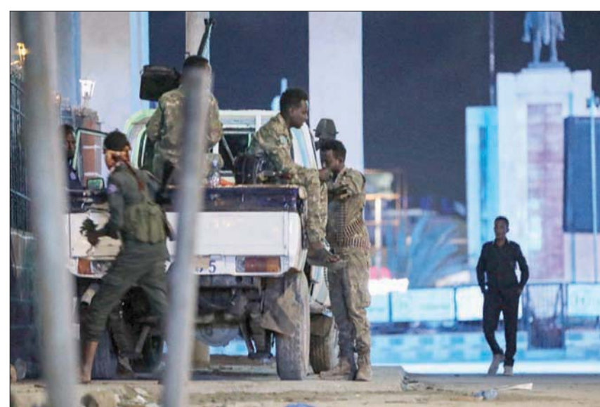
قوة أمنية في محيط الفندق الذي تعرض للهجوم بمقديشو (أ.غ.ب)

وأعربت وزارة الخارجية المصرية في بيان، عن «تضامن مصر الكامل مع الصومال الشقيق في هذا المصائب الأليم»، مشيرة إلى «رفضها التام لكل أشكال العنف والتطرف والإرهاب». وشددت وزارة الخارجية الكويتية في بيان، على «موقف دولة الكويت المبدئي والثابت المناهض للعنف والإرهاب، متقدمة في مناطق ريفية شاسعة وهم قادرون على شن هجمات ضد أهداف مدنية وعسكرية. وتقاتل الحركة المرتبطة بتنظيم «القاعدة» التي تخوض منذ أكثر من عشر سنوات ضد الحكومة الصومالية الضعيفة للسلطة بها وتريد تأسيس نظام للحكم على أساس تفسيرها الصارم للشريعة الإسلامية.