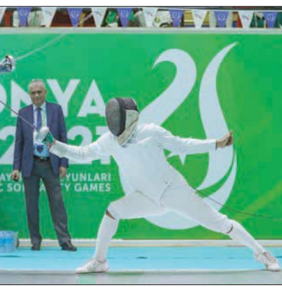
المبارزة السعودية خرجت دون إنجاذ يذكر

وبين أن المنتخب السعودي حقق أهدافه كاملة من خلال هذه المشاركة، حيث تم حصد ميداليات في المسابقتين المقررة والتي شارك بها المنتخب.