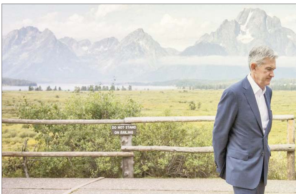
جيروم باول محافظ الفيدرالي الأميركي في مدينة جاكسون الأميركية هول العام الماضي

في منطقة اليورو، وصل ارتفاع الأسعار إلى مستوى قياسي جديد وهو 8,9 في المائة، بينما تشهد بريطانيا أيضاً تضخماً وصل إلى 10,1 في المائة. لذلك، تشير كارولو بيندر في حديث لوكالة فرانس برس إلى أنه «يجب أن يكون هناك كثير من النقاش حول ما إذا كان هناك ضرر كبير على المصدقة»، في ظل الخطأ في تقدير مسار التضخم، وحول «ما يمكن القيام به من أجل إصلاحه».