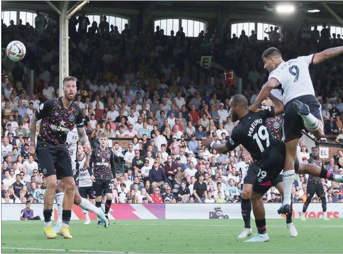
فولهام حقق فوزاً صعباً على برنتفورد