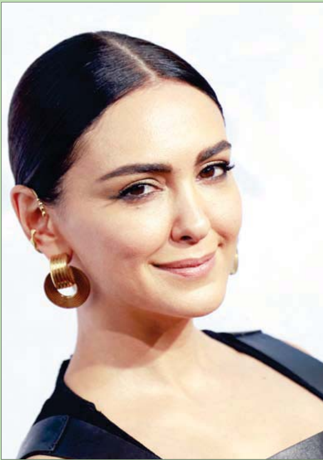
المثلة البريطانية نازنين بونينادي لدى حضورها العرض الأول لفيلم «سيد الخواتم: خواتم القوة» بكاليفر في لوس أنجلوس

خالص العزاء لأسر ضحايا كنيسة أبو سيفين وللامة المصرية جمعاء، ونعلم من هو العدو الحقيقي لوحة الشعب المصري، وأما الحوادث المؤسفة، بغير قصيدة إرهابية - إن كان فعلاً فلا سبب حريق كنيسة إمبابة - فهي تحصل أيضاً مثل حوادث السيارات، وكل ما نرجوه عدم تكرارها وزيادة الاحتياط وترتيبات السلامة.