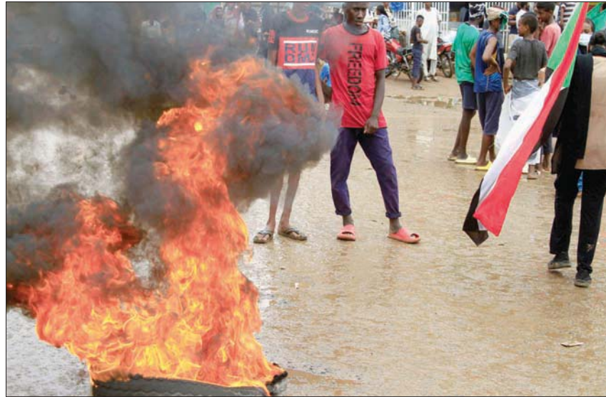
جانبا من احتجاجات في الخرطوم تطالب بعودة الجيش إلى الثكنات وتسليم السلطة للمدنيين

هيكل السلطة الانتقالية. وفي هذا السياق قال صندل: «أكدنا على ضرورة إشراك لجان المقاومة بشكل كبير وفعال في جميع أجهزة الدولة التشريعية والتنفيذية، وحتى في مجلس الشراكة والمفاوضات الجديدة». مشيراً إلى أن مجموعته في انتظار الرؤى المقدمة من قبل مبادرة أهل السودان والمجموعات الأخرى حول الإعلان الدستوري، للتوافق على مسودة دستورية موحدة للفترة الانتقالية. وأبقى الجيش السوداني على وجود الفصائل المسلحة في السلطة، وفقاً لاتفاقية جوبا للسلام، حيث يعتبر قادتها أعضاء في مجلس السيادة الانتقالي ومجلس الوزراء. وفي مطلع الأسبوع الحالي أوصت المبادرة المستديرة، التي تمخضت عن «مبادرة أهل السودان»، بأهمية مشاركة القوات المسلحة إلى جانب المدنيين في أجهزة السلطة خلال الفترة الانتقالية. ودار جدال كبير حول المبادرة التي التف حولها حلفاء سابقون لنظام الرئيس المعزول عمر البشير، والتي تجدد دعماً وتأييداً من جماعة الإخوان المسلمين والجيش. وفي الرابع من يوليو (تموز) الماضي، أعلن قائد الجيش السوداني، عبد الفتاح البرهان، عدم مشاركة المؤسسة العسكرية في الحوار الوطني برعاية الآلية الانتقالية، المكونة من الأمم المتحدة والاتحاد الأفريقي ومنظمة التنمية الأفريقية «إفاد»، وذلك لإفساح الطريق أمام القوى المدنية لتشكيل حكومة انتقالية من كفاءات وطنية مستقلة. ومنذ أكتوبر (تشرين الأول) الماضي تشهد البلاد احتجاجات شعبية مستمرة تطالب بعودة الجيش للثكنات وتسليم السلطة للمدنيين.