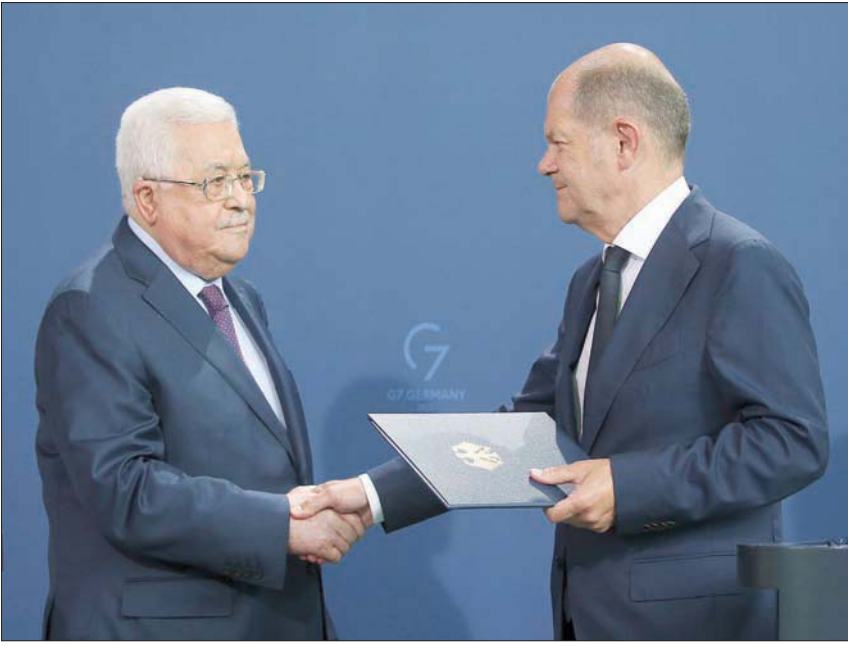
مصافحة بين المستشار الألماني والرئيس الفلسطيني بعد مؤتمر صحفي في برلين الثلاثاء

والسلطة الفلسطينية بكافة الاتفاقيات مع سلطة الاحتلال، ووقف التنسيق الأمني بإشكاليته المختلفة، وتحديد ركائز عملية للاستمرار في عملية الانتقال من مرحلة السلطة إلى مرحلة الدولة ذات السيادة. ويحتل الفلسطينيون بصفة عضو مراقب في الهيئة الأممية، منذ 29 نوفمبر (تشرين الثاني) 2012 لكن بحسب ميثاق الأمم المتحدة، يتطلب الحصول على العضوية الكاملة قراراً من مجلس الأمن يوافق عليه تسعة دول أعضاء، بشرط عدم اعتراض أي من «دول الفيتو»، وهي الولايات المتحدة، وروسيا، وفرنسا، وبريطانيا، والصين. وفسي سياق التحرك الفلسطيني، أعلن مندوب فلسطين الدائم لدى الأمم المتحدة، السفير رياض منصور، استئناف المفاوضات بعدم انتشار أسلحة الدمار الشامل والنووية.