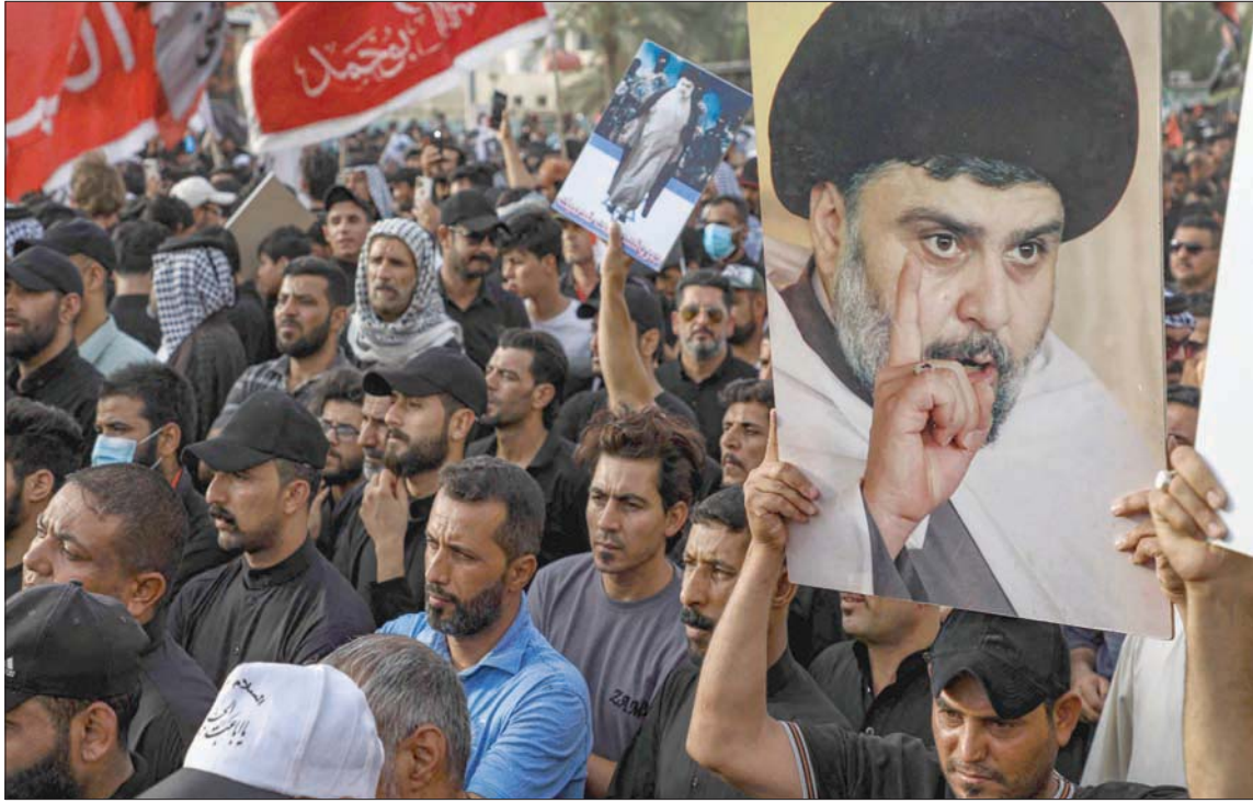
أنصار الصدر يحملون صورة له أثناء تجمعهم في مدينة الناصرية في 12 أغسطس

في سياق ذلك، فإن الصدر الذي لم يسجد القضاء العراقي لطلبه بحل المجلس، لأنه ليس من صلاحياته، مثلما أعلنت السلطة