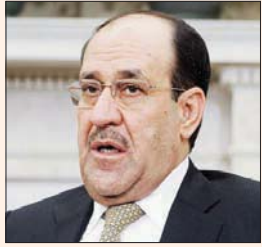
نوري المالكي