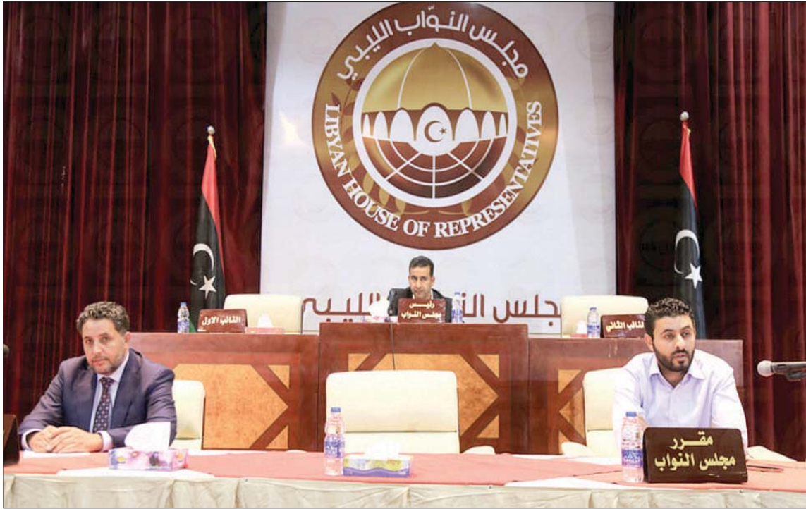
جانب من جلسة مجلس النواب الليبي بطريق أمس

إلى ذلك، اعتبر الديببة أن ما يهّم الليبيين هو تقديم الخدمات ومعالجة الأوضاع، وإيجاد الحلول الحقيقية للأزمات التي يعيشونها. وفي المقابل، دعا فتحى باشاغا، رئيس حكومة «الاستقرار»، لقيمة الدينار الليبي، لافتاً إلى تأثير الأزمة الاقتصادية على الاقتصاد الوطني، وتداعيات الأزمة العالمية، وارتفاع أسعار السلع على انخفاض القوة الشرائية للعملة المحلية، وانعكس وقابله الوخيمة على المواطنين وزاد من معاناتهم. وبعدما أكد في خطاب رئيس وأعضاء المصرف استعداد حكومته للعمل والتعاون لتحقيق أهداف تعزيز الاقتصاد الوطني والاستقرار المالي والنقدي، تعهد باشاغا باتخاذ الحكومة كافة الإجراءات والترتيبات الكفيلة بتخفيض الإنفاق المتسبب في التضخم، بما يتوافق مع السياسة النقدية للمصرف المتعلقة بقواعد تعديل سعر الصرف.