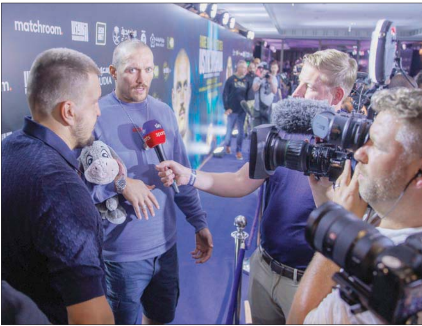
الملاكم الأوكراني يتحدث للإعلاميين في فعالية تسبق «نزال البحر الأحمر»

وتتم إطلاق الفيلم التسويقي بمسرح من الإصدارات تتراوح مدتها بين دقيقتين و60 ثانية و30 ثانية و15 ثانية ستعرض على منصات التواصل والقنوات التلفزيونية.