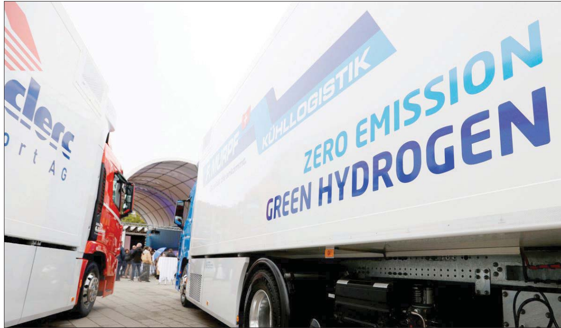
يتزايد الاهتمام في أرجاء أوروبا بالهيدروجين الأخضر لدواعٍ مناخية ومع تزايد مخاوف أمن الطاقة على خلفية الحرب الأوكرانية

مستخدمة في المستقبل المنظور لأن اقتصاد الهيدروجين لم يتطور حقاً، إنه في مرحلة مبكرة فحسب».