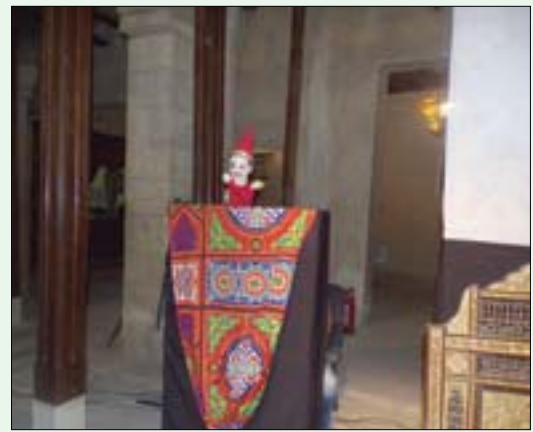
مشهد من عرض «صندوق الحكايات»