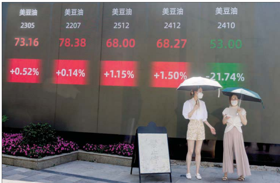
يعتزم بنك الشعب إصدار سندات بـ 3.69 مليار دولار في هونغ كونغ لإثراء منتجات استثمار مقيمة باليوان (إب.أ)

ضح بنك الشعب الصيني (البنك المركزي)، أمس الثلاثاء، ملياري يوان (نحو 295.3 مليون دولار) في النظام المصرفي عبر عمليات إعادة الشراء العكسي للحفاظ على السيولة، بحسب ما أوردته وكالة أنباء الصين الجدية (شينخوا)، في الوقت الذي يستعد فيه لإصدار سندات في هونغ كونغ. ووفقاً لبنك الشعب الصيني، فقد تم تحديد سعر الفائدة على اتفاقيات إعادة الشراء العكسي لمدة سبعة أيام عند 2 في المائة. وقال البنك المركزي إن هذه الخطوة تهدف إلى الحفاظ على استقرار السيولة في النظام المصرفي.