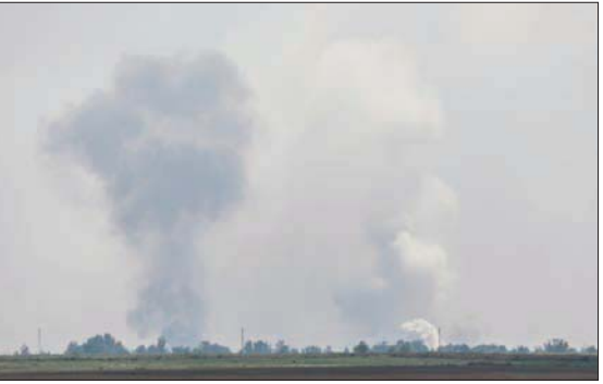
أعمدة الدخان تتصاعد من موقع الانفجارات الجديدة في القرم