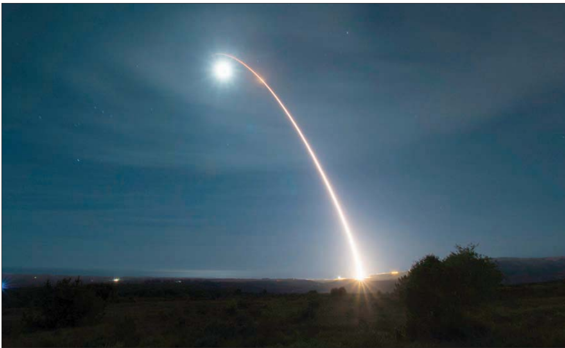
صورة تعود إلى 5 فبراير 2020 لاختبار تطويري للصاروخ الباليستي العابر للقارات من طراز «مينيتمان 3»

وقال قائد قوة المهام التدريبية الميجور أرماند وونغ إن عملية التخطيط الدقيقة لكل عملية إطلاق تستغرق عادة ستة أشهر إلى عام قبل الإطلاق، «وإد عمل أفضل طيارينا من كل قطاعات الصواريخ جنبا إلى جنب مع سرب القوة الجوية 576 لعرض بعض المهارات الفنية التي تشكل قلب مهمتنا في الردع النووي».