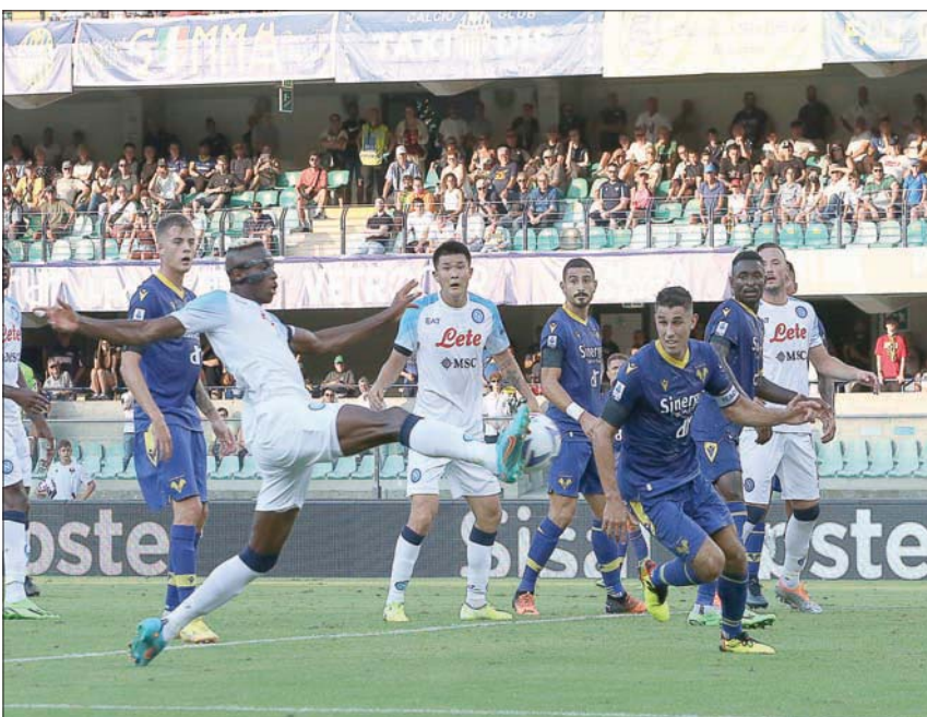
من مباراة نابولي أمام هيلاس فيرونا