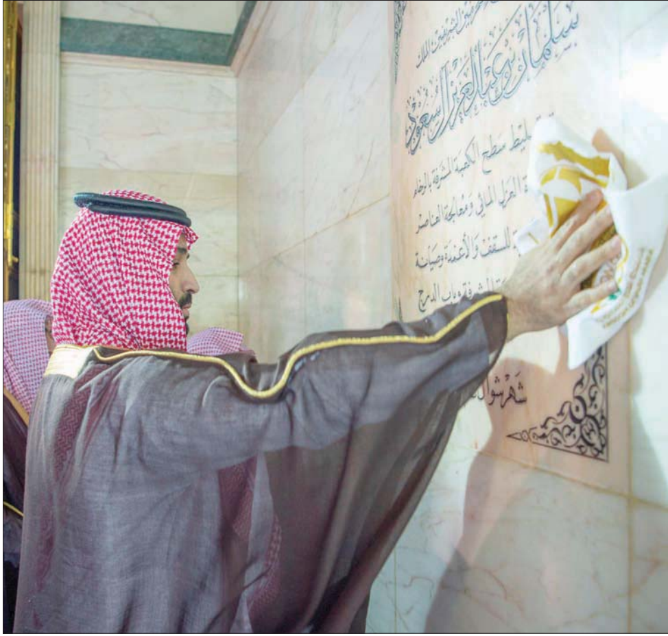
ولي العهد يمسح جدار الكعبة المشرفة بالطيب وماء زمزم