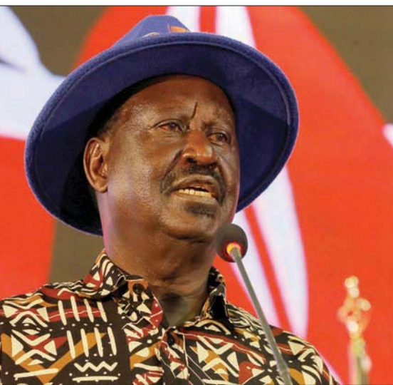
زعيم المعارضة رايلأ أودينغا يوجه خطاباً إلى الأمة أمس

المخضرم، الذي خسر محاولته الخامسة للرئاسة، انتصاره على الحفاظ على السلام وعدم تطبيق القانون بأيديهم». كان أودينغا طعن في عام 2007 بنتيجة الانتخابات، عندما تسببت الأزمة التي تلت الانتخابات بمواجهات بين العرقيات أدت إلى مقتل 1100 شخص. وفي 2017، أبطلت المحكمة العليا نتائج الانتخابات الرئاسية «غير الشفافة وغير القابلة للتحقق»، ملقية باللوم على اللجنة المشرفة.