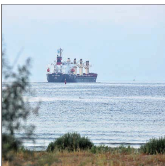
سفينة تحمل 23 طناً من القمح وترفع العلم اللبناني تغادر الثلاثاء ميناء أوديسا الأوكراني (أ.ب.)

من روسيا. وتضمنت الاتفاقية تأمين صادرات الحبوب العالقة في الموانئ الأوكرانية على البحر الأسود، والتي تبلغ أكثر من 20 مليون طن، إلى العالم. في السياق ذاته، بحث وزير الدفاع التركي خلوصي أكار مع نظيره الأوكراني أوليغس ريزنيكوف، في اتصال هاتفي الثلاثاء، آخر المستجدات في أوكرانيا، وملف تصدير الحبوب الأوكرانية إلى الأسواق العالمية. وذكر بيان لوزارة الدفاع التركية، أن كبار أصدقاء الاتحاد الأوروبي، في أعقاب المضي، في إسطنبول، التي سحمت باستئناف صادرات الحبوب من الموانئ الأوكرانية على البحر الأسود، بعد توقفها لخمس أشهر بسبب الحرب، إضافة إلى الأسمدة والمنتجات الزراعية