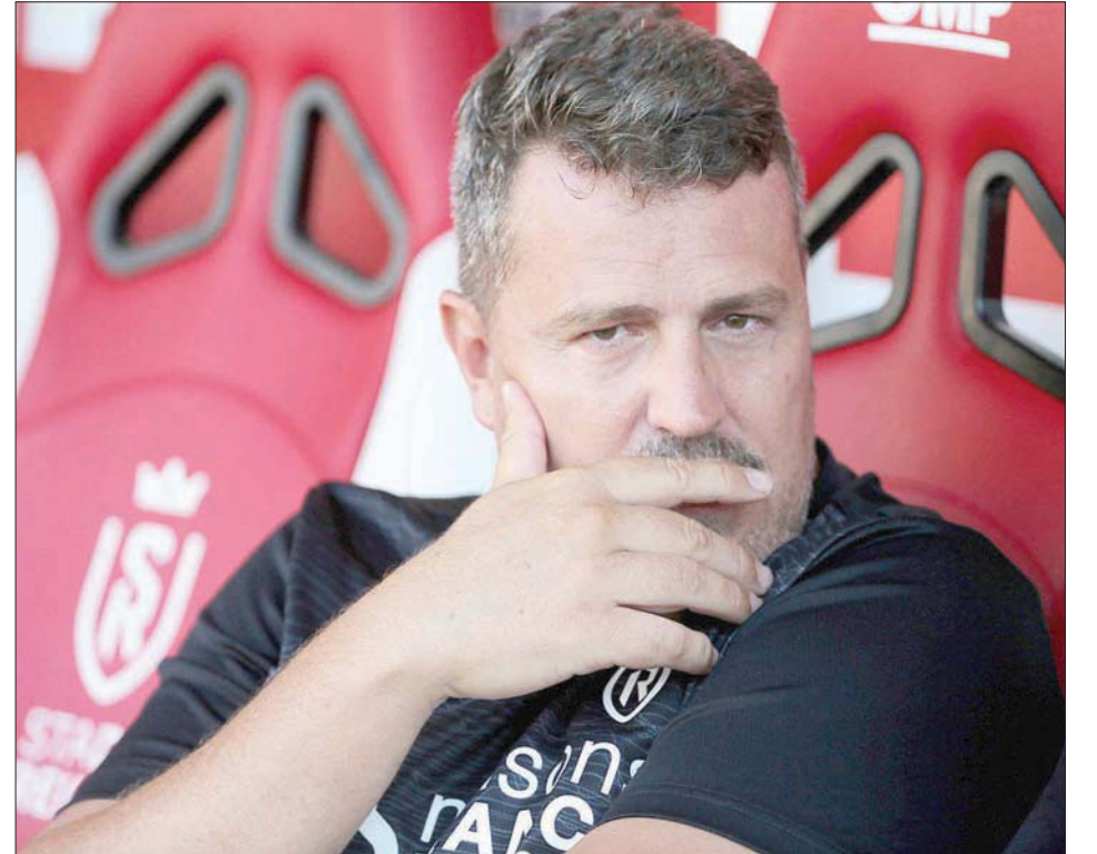
على مقاعد البدلاء، خلال تدريبات فريقه (أغب)

● هل تعتقد أن المديرين الفنيين يواجهون ضغوطا كبيرا لا يمكنهم تحملها؟