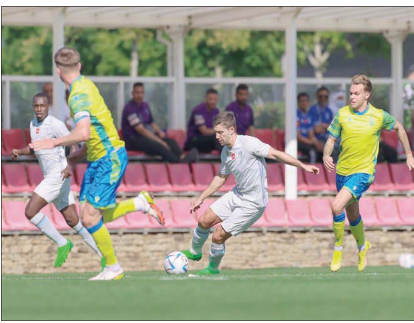
الهلال أسقط نوتنغهام فورست الإنجليزي بسداسية في معسكره البريطاني (المركز الإعلامي بنادي الهلال)

وأخيراً فقد احتضنت سلوفينيا معسكر العدالة، ولعب 4 مواجهات؛ الأولى أمام نادي أبولون اليوناني تمكن من الانتصار فيها بثلاثة أهداف مقابل هدف، والثانية خسرهما من نادي بارادو الجزائري 2 - 1، والثالثة كانت أمام نادي شاختر دونستك الذي فاز بهدف وحيد، أما اللقاء الرابع فجاء أمام نادي ون كي جارون الكرواتي الذي انتصر عليه العدالة 3 - 2.