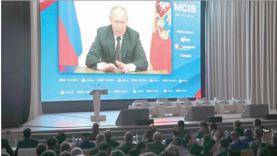
بوتين خلال حديثه أمس عبر الفيديو

مع أن الحديث الروسي عن انتهاء «هيمنة القطب الواحد» والشروع بوضع أسس لعالم متعدد الأقطاب، تكرر كثيراً منذ بدء «العملية العسكرية» في أوكرانيا، لكن الإشارات التي وجهها الرئيس فلاديمير بوتين في خطابه أمس (الثلاثاء) أمام مؤتمر «الأمن الدولي» الذي تنظمه وزارة الدفاع في موسكو بحضور وفود عسكرية وأمنية رفيعة من عشرات الدول، بدت واضحة بانحياز ميل روسيا نحو توسيع نطاق المواجهة مع الغرب، ووضع مسار محدد يقوم على حشد تحالف من البلدان التي تتفق مع مواقف الكرملين، في مواجهة المحاور والتحالفات التي تقودها واشنطن، مثل حلف الأطلسي و«تحالف أوكوس» الذي يضم بالإضافة إلى الولايات المتحدة بريطانيا وأستراليا، ومساعدتها إلى إقامة محاور جديدة على غرار «الناتو» في آسيا ومناطق أخرى.