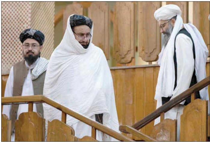
وزير التعليم العالي في «طالبان» الأفغانية عبد الباقي حقاني (وسط) قبل لقائه كلمة في مؤتمر صحفي في كابل أول من أمس