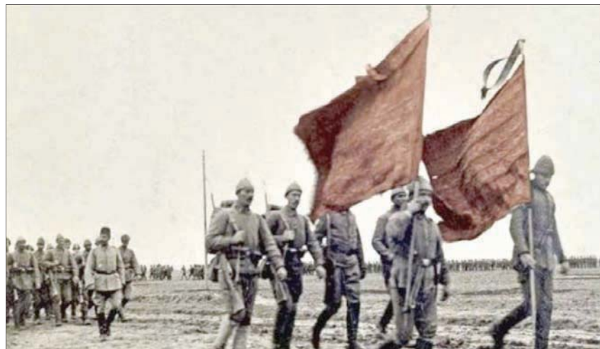
انسحاب الجيش البريطاني من الكوت عام 1916 بعد هزيمته

وهكذا تصبح مدينة الكوت التي كان عدد سكانها آنذاك لا يزيد عن 5 آلاف شخص، مركزاً لهذا الحدث الروائي. ومع أن المدينة