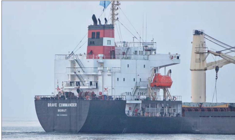
تراجعت أسعار الحبوب في بورصة شيكاغو مع تخفيف الضغوط العالمية التي شملت حلحة الصادرات الأوكرانية

واصلت العقود الآجلة للذرة والقمح ووقود الصويا في شيكاغو خسائرها، يوم الثلاثاء، متأثرة بالمخاطر الاقتصادية في الصين، وتوقعات بتأثير أخف للأمطار على المحاصيل الأميركية، وزيادة الشحنات من أوكرانيا التي مرقتها الحرب.