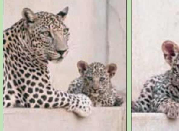
النمر العربي أحد أكثر الحيوانات المهددة بالانقراض في العالم

تاهيل البيئة الطبيعية مع ما يتماشى مع الأهداف الوطنية، من ذلك مبادرة «السعودية الخضراء»، لتصبح 80 في المائة من مساحة العلا محميات طبيعية. وتمضي الهيئة الملكية لمحافظة العلا قدماً في تحقيق استراتيجيتها الخاصة بالنمر العربي، التي تشمل جوانب مجتمعية متعددة، منها تدريب عدد من أبناء وبنات الوطن في العلا على مهام دعم صون المحميات الطبيعية.