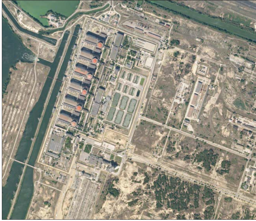
صورة التقطت من الجو في السابع من الشهر الجاري للمحطة النووية في زابوريجيا

شويغو والأمين العام للأمم المتحدة أنطونيو غوتيريش في موسكو. وقالت وزارة الدفاع الروسية في بيان لها إن «شويغو أجرى مفاوضات هاتفية مع غوتيريش، بشأن شروط التشغيل الآمن للمحطة» وهي الأكبر في أوروبا. مع الإشارة إلى أن المحافون من وقوع كارثة نووية، دفعت مجلس الأمن الدولي إلى عقد اجتماع يوم الخميس الماضي، دعا فيه غوتيريش إلى وقف أي نشاط عسكري حول المجمع النووي، بعد أن تبادلت موسكو وكيف الاتهامات بقصف محطة. كما جاء هذا الاتصال بعد أن أكد المتحدث باسم الأمم المتحدة ستيفان دوجاريك أن لدى المنظمة الدولية القدرات اللوجستية والأمنية اللازمة لدعم زيارة مفتشين تابعين للوكالة الدولية للطاقة الذرية إلى زابوريجيا إذا وافقت روسيا وأوكرانيا. وكان دوجاريك يرد على اتهام روسي للأمانة العامة للأمم المتحدة بمنع قيام مفتشين من الوكالة الدولية للطاقة الذرية بزيارة أكبر محطة للطاقة النووية في أوروبا، وقال «ليس للأمانة العامة للأمم المتحدة سلطة منع أو إلغاء أي أنشطة للوكالة الدولية للطاقة الذرية». وأوضح: «من خلال الاتصال الوثيق مع الوكالة كان تقييم الأمانة العامة أن لديها في أوكرانيا القدرات اللوجستية والأمنية التي تمكنها من دعم أي بعثة إلى المحطة من كييف»، لكنه قال إن روسيا وأوكرانيا يجب أن توافقا على ذلك. غير أن وكالات أنباء روسية نقلت عن دبلوماسي روسي كبير (الإنش)، أن أي زيارة تقوم بها الوكالة الدولية للطاقة الذرية لتفقد محطة زابوريجيا «لا يمكن أن تمر عبر العاصمة كييف، لأن الأمر ينطوي على خطورة بالغة». وقال نائب رئيس «إدارة الانتشار النووي والحد من