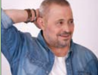
الفنان جورج وسوف

حتى تلقاه منه. يعلق وسوف على التحولات التي يشهدها المجتمع وأخلاق البشر متسائلاً: «مقول هيك صارت الدنيا؟ افتقدنا أموراً كثيرة في هذه الأيام؛ خصوصاً الوفاء. وكان الناس نسبت ربهما واختصرت الحياة بالإشغال والمصالح والفلوس. هذا كله فان». لم يعد الفنان كلام العتب إلا في أغنياته؛ لكن الجالس معه يلاحظ بين سطوره خيبة من ناس قل إخلاصهم: «متأسف على ناس فقدوا وديع»، أو تأثر بهم: «من عبد الوهاب ووردة وعبد الحليم وفريد الأطرش وأسماهان، مروراً بعاصي ومنصور والياس وزينب الرحباني، وصولاً إلى صباح ووديع الصافي ونصري حتى تلقاه منه. يعلق وسوف على التحولات التي يشهدها المجتمع وأخلاق البشر متسائلاً: «مقول هيك صارت الدنيا؟ افتقدنا أموراً كثيرة في هذه الأيام؛ خصوصاً الوفاء. وكان الناس نسبت ربهما واختصرت الحياة بالإشغال والمصالح والفلوس. هذا كله فان». لم يعد الفنان كلام العتب إلا في أغنياته؛ لكن الجالس معه يلاحظ بين سطوره خيبة من ناس قل إخلاصهم: «متأسف على ناس فقدوا وديع»، أو تأثر بهم: «من عبد الوهاب ووردة وعبد الحليم وفريد الأطرش وأسماهان، مروراً بعاصي ومنصور والياس وزينب الرحباني، وصولاً إلى صباح ووديع الصافي ونصري