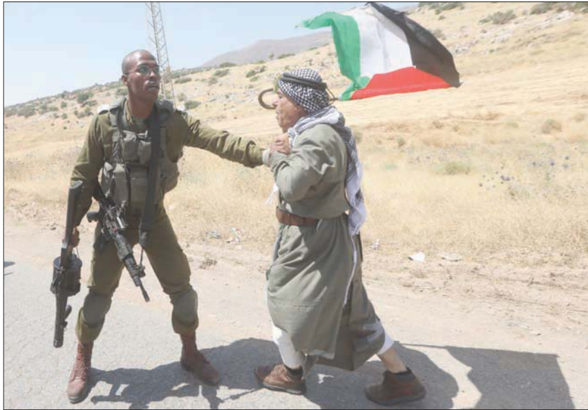
جندي إسرائيلي يتجادل مع فلسطيني أثناء محاولته الوصول إلى طوباس بغور الأردن

أن الإمارات تشترط إلغاء الضم لكي تنضم إلى مشروع التطبيع مع إسرائيل. فراح كوشنر يماطل في إعطاء الموافقة على الضم، في البداية بحجة «كورونا»، وفي النهاية كشف حقيقة اتفاقه مع الإمارات على إلغاء الضم. ونشرت صحيفة «جيزوراليم بوست» أجراها صهر ترمب وكبير مستشاريه، جاريد كوشنر، أن كل شيء كان جاهزاً في واشنطن للموافقة على ضم حوالي ثلث الأراضي الفلسطينية في الضفة الغربية إلى إسرائيل. والمقصود بذلك الثلث، منطقة غور الأردن وشمالي البحر الميت التي تشكل 30 في المائة، والمستوطنات اليهودية في شتى أنحاء الضفة الغربية وتشكل 3,5 في المائة من مساحة الضفة، مقابل موافقة إسرائيل على قيام دولة فلسطينية في الثلثين الباقيين من الضفة الغربية، وبضمها جزءاً من القدس الشرقية يصبح عاصمة للدولة الجديدة. فقد وافق الطاقم الأميركي كله على ذلك، وبعث الرئيس ترمب برسالة تؤكد موافقته، وسافر نتانياهو إلى واشنطن للاتفاق النهائي على ذلك، وسافر وفدان من قيادة المستوطنات إلى واشنطن، أحدهما حاول مساندة نتانياهو والثاني اعتبر القرار خطأ؛ لأنه يقم دولة فلسطينية. ولكن كوشنر الذي كان يعتبر الشخصية المركزية الأولى في فريق ترمب، كان يخطط لإسرائيل هدية استراتيجيّة، وهي إقامة علاقات تطبيع وسلام مع دول عربية جديدة. وقد وجد