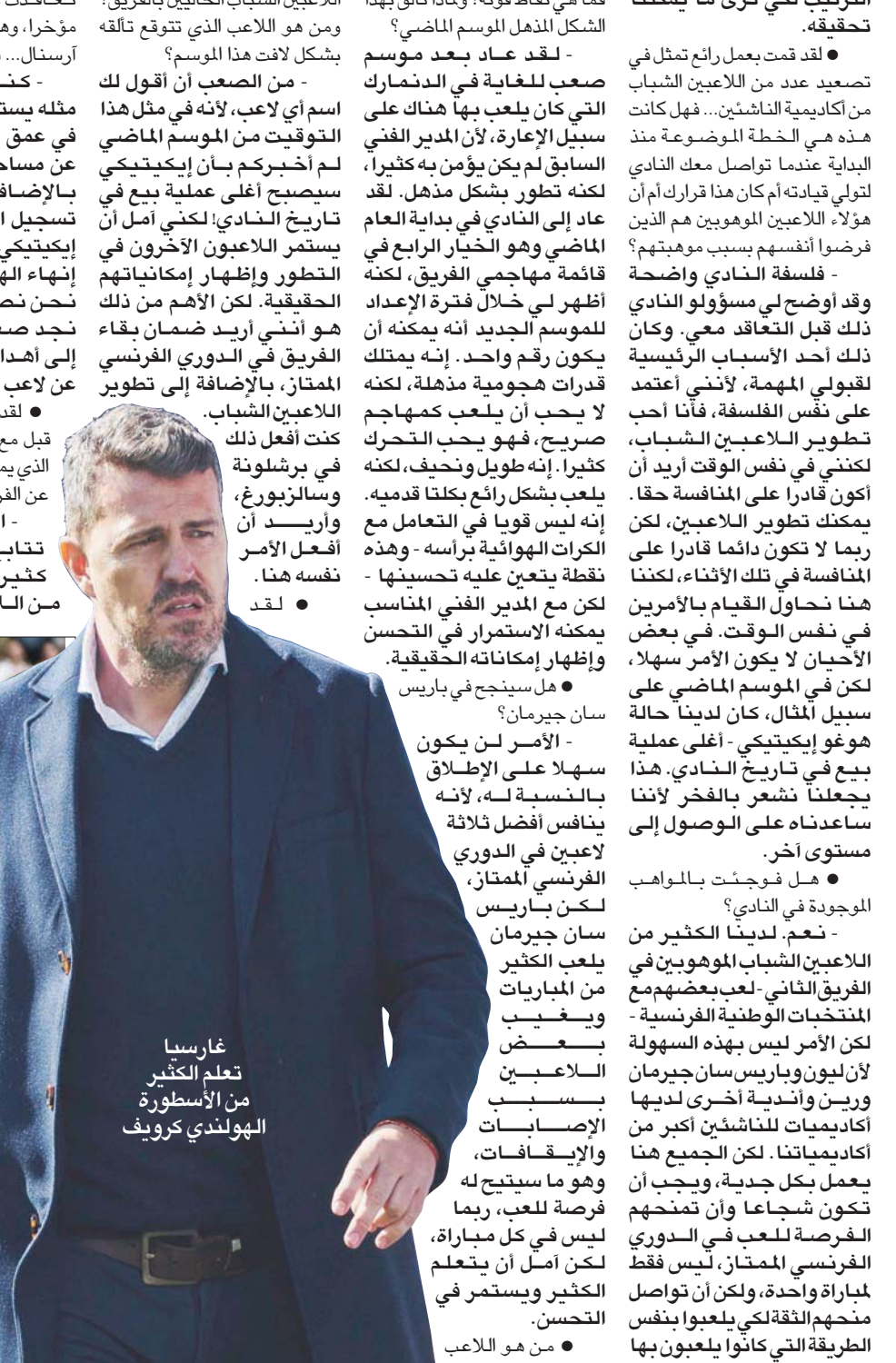
غارسيا تعلم الكثير من الأسطورة الهولندي كروفيا

للي يوهان كروفيا. لكن بضعفت بالمواهب الموجودة في النادي؟