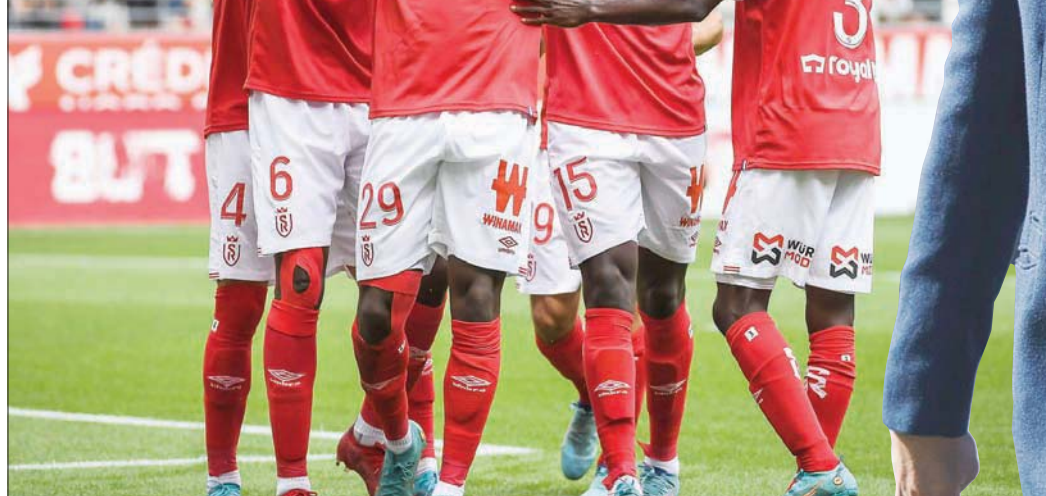
لاعبو ريمس يحتفلون بأحد أهدافهم

- منزلي يكون دائما على أرض الملعب! لقد قضيت وقتا رائعا في إنجلترا، ومن أهدافي أن أعمل في مجال التدريب هناك مرة أخرى، لأن الأجواء والمشجعين والدوري رائعون. أحد أهدافي الرئيسية هو العودة للعمل في إنجلترا يوما ما، لكنني الآن أركز بشكل كامل على فريقتي وعلى النادي الذي أتولى قيادته في فرنسا. ريمس هو النادي الذي يساعدني حقا على مواصلة التطور ولديه القدرة على النمو والتحسين، في ظل امتلاكه لأكاديمية رائعة