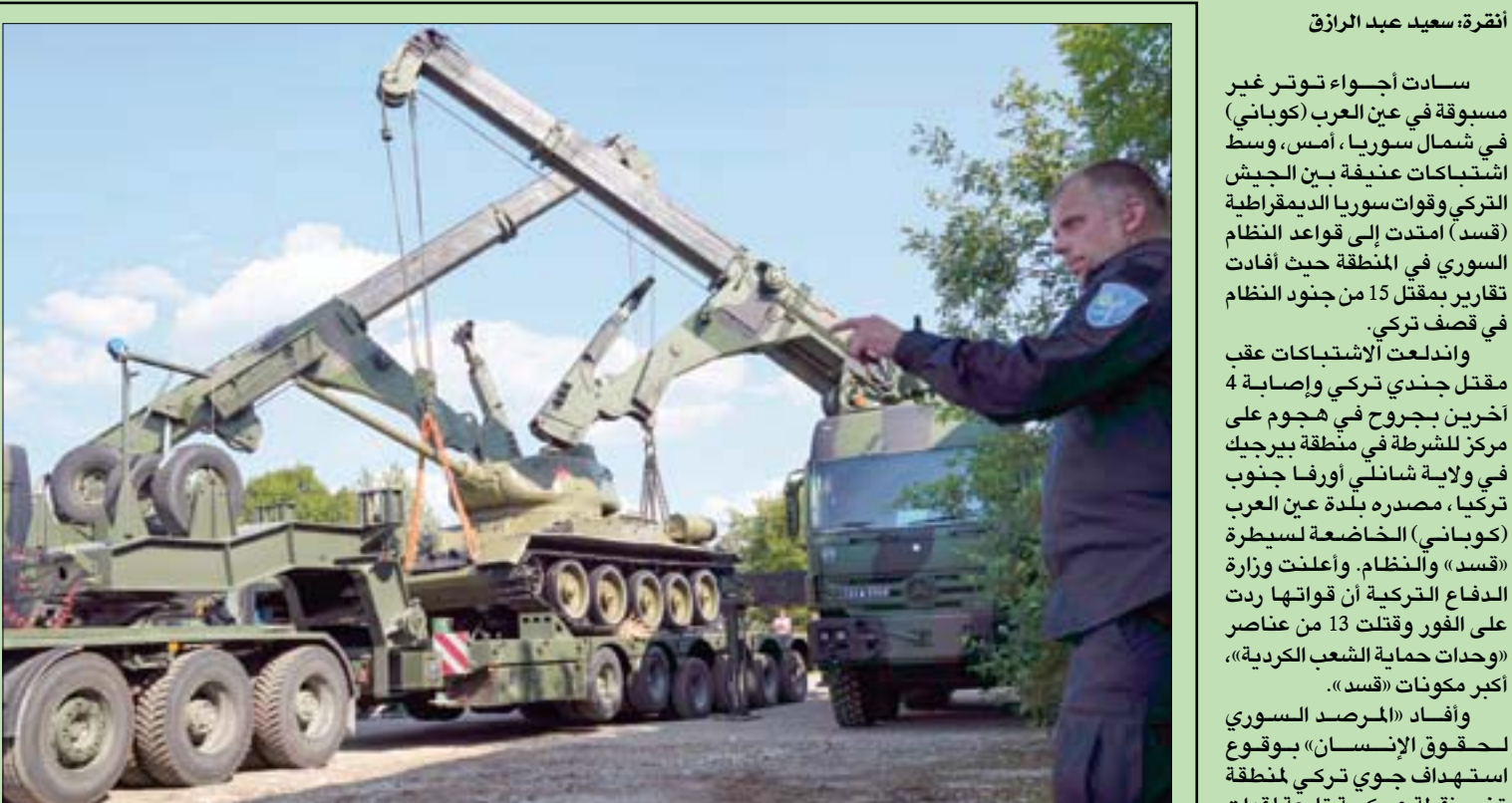
رافعات تُنزل دبابة تعود إلى الحقبة السوفياتية من طراز «تي - 34» وُضعت كـ«نصب تذكاري» أمام المتحف العسكري في العاصمة الإستونية تالين أمس بعد نقلها من مدينة نارفا على بحر البلطيق خوفاً من اضطرابات