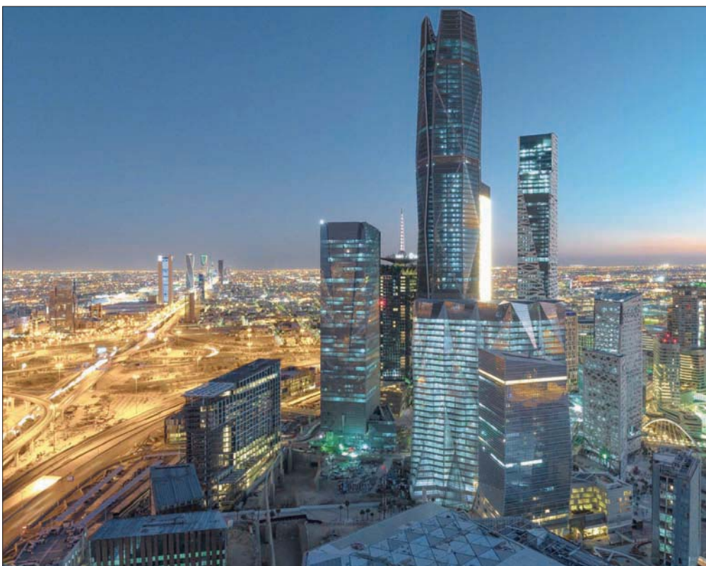
السعودية تزيد استثماراتها في الأوراق المالية والأسواق الأميركية لتنويع مصادر دخل الاقتصاد الوطني

ويمتلك صندوق الاستثمارات العامة في العديد من الشركات الكبرى