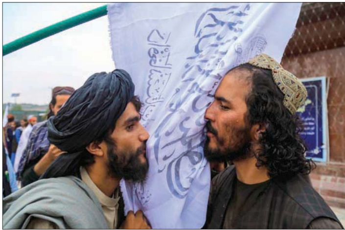
احتفالات عناصر «طالبان» بالذكرى السنوية الأولى لسيطرتهم على كابل

قال إنه يجب على دول المنطقة تعزيز قدرة أفغانستان على مكافحة الإرهاب والجماعات الإرهابية التي تشكل تهديداً للسلام والأمن الإقليميين». وتواصل الهند -من جانبها- التأكيد على دور باكستان في مكافحة الإرهاب في المنطقة، وتشعر بالقلق إزاء التعاون بين الشائعية (الولايات المتحدة وباكستان، بالإضافة للصين في أفغانستان بخير قلق الهند. ومنذ عام 2014، تعهدت بكن بتقديم مساعدات اقتصادية لأفغانستان، وشاركت في الاجتماعات الثلاثية (الولايات المتحدة والصين وأفغانستان) والرباعية (الولايات المتحدة والصين وباكستان وأفغانستان) حول أفغانستان.