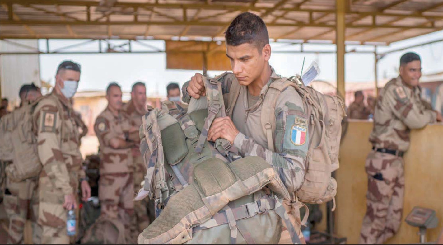
جنود من قوة «برخان» الفرنسية يغادرون مالي أمس

اليوم، وبعد أن خرجت «برخان» من مالي يُطرح سؤالاً: الأول، هل ستكون القوات المالية بدعم من «فاغنر» قادرة على احتواء ومحاربة التخطيحات الجهادية، على أراضيها خصوصاً أنها نجحت في التمدد في المناطق الشمالية وعاودت القيام بعمليات عسكرية معقدة والأخر يتناول مصير البعثة العسكرية الأوروبية التي تقوم بتدريب القوات المالية ومصير القوات الدولية «مينوسا» المنتشرة في مالي منذ سنوات. وهذا السؤالان جديان، والصعوبة بصددهما أن لا أحد يملك جواباً عنهما بسبب تعقيدات المشهد المالي. من هنا، فإن الأوزاع في هذا البلد الذي يعد من الأقر في العالم مفتوحة على الاحتمالات كافة.