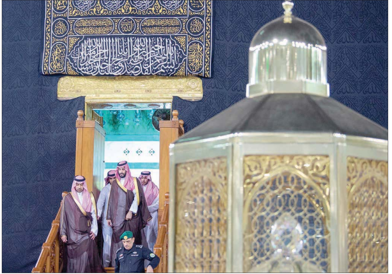
ولي العهد بعد الانتهاء من غسل الكعبة المشرفة (واس)