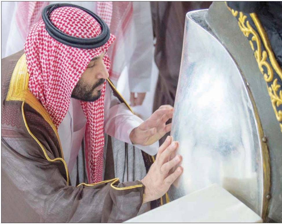
الأمير محمد بن سلمان يمسح جدار الكعبة المشرفة بالطيب وماء زمزم

«وطهرُ يَتِيَّ لِلطَّائِفِينَ وَالْقَائِمِينَ وَالرُّكَّعِ السُّجُودِ». وتُغسل الكعبة المشرفة عادة من الداخل بماء زمزم المخلوط بماء الورد، بتدليك جدرانها من الداخل بقطع القماش المبلل بالمخلوط الذي يُحضَّر منذ وقت مبكر، ثم تتعطر بعطر العود الذي يتجاوز سعر الكيلو منه 10 آلاف دولار وتظل رائحة العطر بها حتى موعد غسلها الثاني، كما تُستخدم مكنسة يدوية لتنظيف الكعبة من الغبار والأتربة قبل الغسل، ومكنسة يدوية أخرى لتوزيع العطر الخاص بالكعبة المشرفة من دون أن تعيق حركة قاصدي المسجد الحرام، وماء الورد يُستخدم لتطهير الكعبة من الداخل كالأرضية والجدار الداخلي. وتستخدم الرئاسة العامة في أعمال التطهير والتطيب بالمسجد الحرام موادٌ جُلبت خصيصاً لهذه الغاية، ويتم تجهيز المواد والأدوات اللازمة لأعمال التطهير، والتأكد من وجود المعدات التي ستستخدم داخل المنطقة المحيطة