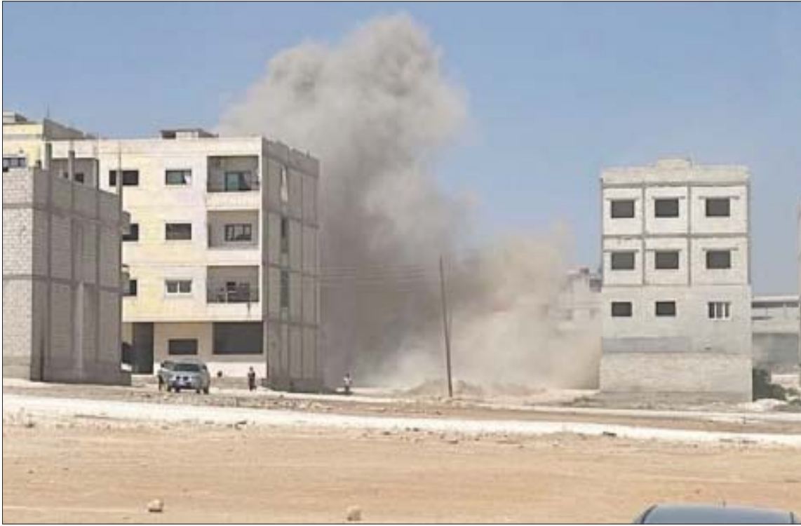
صورة نشرها «المرصد السوري» للقصف التركي على عين العرب (كوباني) وريفها الثلاثاء،

وأفاد المرصد السوري لحقوق الإنسان، بوقوع استهداف جوي تركي لمنطقة تضم نقطة عسكرية تابعة لقوات النظام في تل جينة الواقعة بريف عين العرب، شرق محافظة حلب، وسط تحليق لطيران حربي في الأجواء التركية. وتقع المنطقة عند الحدود مع تركيا مباشرة. في الوقت ذاته، أطلقت 4 قذائف هاون باتجاه مدينة غازي عنتاب من المناطق الخاضعة لسيطرة قسد شرق نهر الفرات، شمال شرقي سوريا، سقطت في حقول خالية في بلدة كاركاميش، ولم تتسبب في إصابات. وقال والي غازي عنتاب داود غل، في بيان، إنه تم الرد على الهجوم بالمثل، وأصدرت بلدية غازي عنتاب تحذيرا للمواطنين لعدم