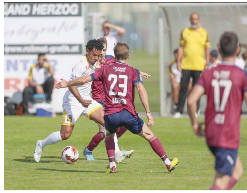
الاتحاد سجل نتائج إيجابية في معسكره النمساوي (المركز الإعلامي بنادي الاتحاد)

التي أقيم فيها معسكره في مورسيا الإسبانية؛ كان الأول مقابل فريق منيرفا الإسباني وفاز فيه بهدف نظيف، والثاني أمام إنترستيتي الإسباني خسره بهدف دون رد، أما الثالث فكان بمقابل إيركوليس الإسباني وخسره أيضاً بهدف وحيد، والرابع جاء أمام نادي ليفانتي الإسباني وانتهت بالتعادل الإيجابي بهدف لهدف، أما المباراة الخامسة فقد خسرهما النادي الغربي بنتيجة أربعة أهداف دون مقابل لتصلح نادي مورسيا الإسباني بثلاثة أهداف دون مقابل.