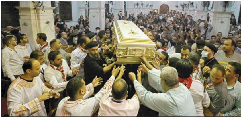
مصريون يشيعون ضحايا حريق كنيسة الجيزة الذي راح ضحيته 41 شخصاً (أ.ف.ب)

كما تطرق البابا إلى ما وصفه بـ«الأكاذيب التي تُطرح» بشأن الحريق، وقال إن صفحات السوشيال وبعض القنوات التلفزيونية (تذيع) أموراً لا تليق حتى بحرمته الموت وحرمة الحاد، لكن بعض الناس أثاروا الشر والأكاذيب، والشائعات غير الحقيقية، والتي تتضمن توجيه القسور والانتهاج للناس». في غضون ذلك قالت وزارة الداخلية، إنها تلقت بلاغاً بـ«تصاعد أدخنة وحريق بجدران المغلقة بكنيسة الأنا بشيوي بالمنايا (صعيد مصر)، وإنها تخطت من السيطرة على الحريق وإخماده دون وقوع أي خسائر في الأرواح».