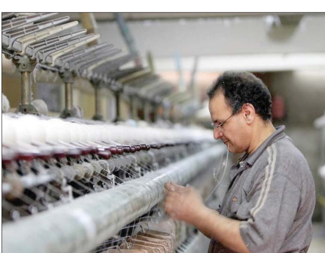
عامل في مصنع غزل ونسيج بالحلقة الكبرى في مصر

في وضع وتنفيذ رؤية الدولة المصرية ممثلة في وزارة التجارة والصناعة للارتقاء بقطاعي التصنيع والتصدير». في الأثناء، أفادت بيانات أولية من الجهاز المركزي للتعبئة العامة والإحصاء وصول العالم إلى الحد الصفوي لانبعاثات بارترافح الرقم القياسي لإنتاج الصناعات التحويلية والاستخراجية 3,91 في المائة على أساس شهري في مايو (أيار).