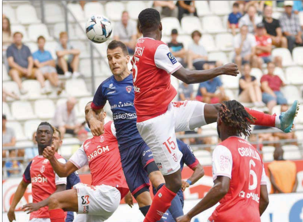
من إحدى مباريات استاد ريمس في الدوري الفرنسي

- سيكون موسمنا صعبا للغاية، نظرا لأن بطولة كأس العالم ستقام في منتصف الموسم، بالإضافة إلى أن أربعة أندية ستتهبط من الدوري الفرنسي الممتاز بنهاية هذا الموسم. إنه دوري تنافسي وصعب دائما، لكن هذا العام يتوقع الجميع أن يكون الأمر أكثر صعوبة. سنواجه الأمر بثقة كبيرة، وبأساليب مماثلة لتلك التي أتت ثمارها العام الماضي. هدفنا الأول هو ضمان البقاء في الدوري الفرنسي الممتاز في أقرب وقت ممكن، وبعد ذلك سيكون أمامنا الوقت الكافي لتحقيق أهداف أعلى. وفي آخر 10 مباريات من الموسم، ربما سنبدأ في النظر إلى جدول