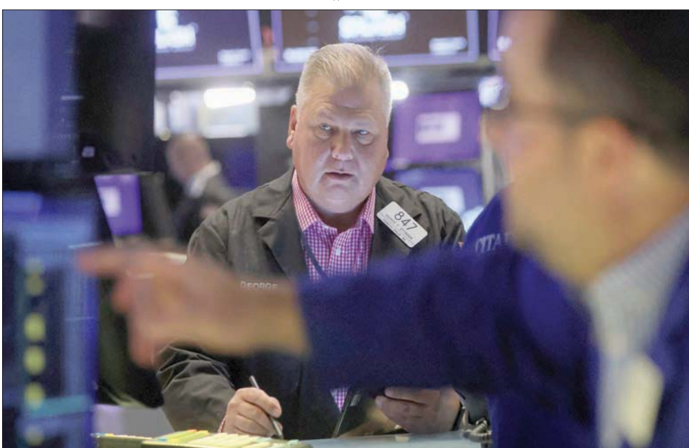
ظلت الأسواق تحت ضغوط واسعة النطاق نتيجة بيانات صينية مثيرة للتوتر وقلق على مستقبل الفائدة

ومن جانبها، أغلق المؤشر نيكي الياباني دون تغير يذكر، وكانت الأسهم المرتبطة بالطاقة وشركات الشحن الأكثر خسارة، في حين انخفضت المعنويات بفعل المخاوف إزاء تباطؤ الاقتصاديين الأميركي والصيني. وأغلق المؤشر نيكي منخفضاً 0,01 في المائة عند 28868,91 نقطة، منهيًا مكاسب على مدى يومين جملته عند أعلى