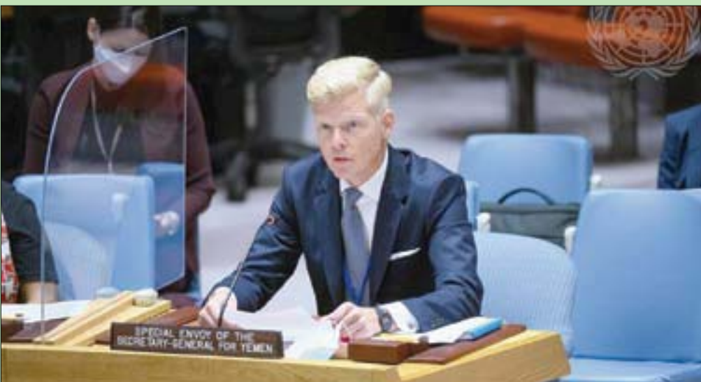
المبعوث الأممي إلى اليمن هانس غرونديبرغ أثناء إحاطته أمام مجلس الأمن للأمم المتحدة

على التزام الحكومة في بلاده بنهج وخيار السلام الشامل والمستدام، المبني على مرجعيات الحل السياسي المتفق عليها، وهي: المبادرة الخليجية واليتمها التنفيذية، ومخرجات مؤتمر الحوار الوطني الشامل، وقرارات مجلس الأمن ذات الصلة، وعلى رأسها القرار 2216 الذي يمثل ركيزة أساسية ومرجعية ثابتة لعملية السلام التي تقودها الأمم المتحدة؛ وفق تعبيره.