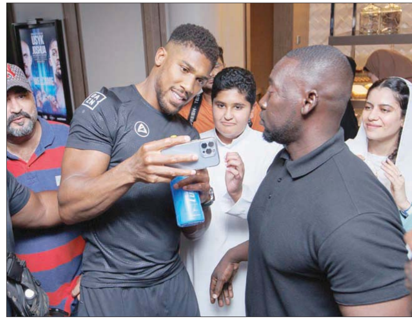
جوشوا يلتقط «سيلفي» مع بعض معجبيه في جدة