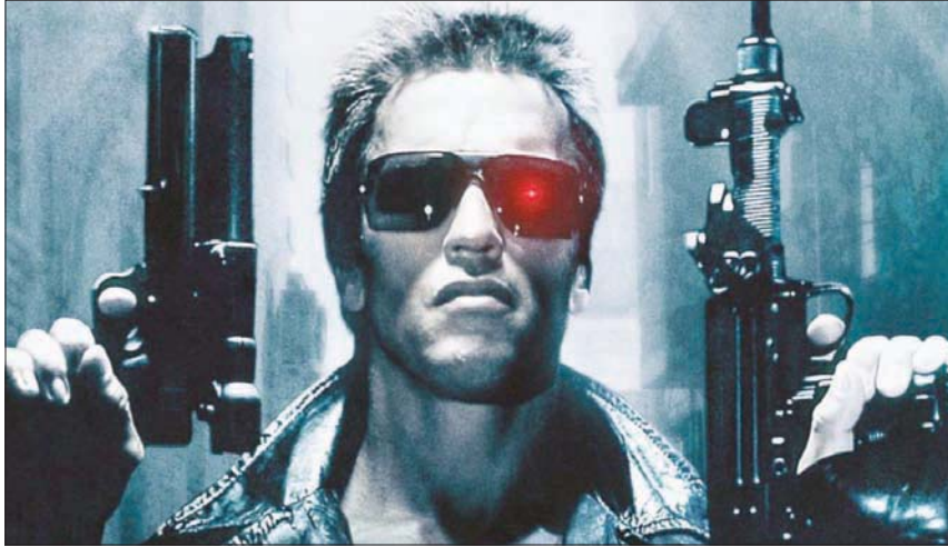
آرنولد شوارتزنيغر في «ذا ترميناتور»

من هذا الانتصار إلى آخر. المخرج جيمس كاميرون قرر أن شوارتزنيغر، كونه لا يجيد التمثيل بقدر ما يجيد الحضور، أسند إليه بطولة «ذا ترميناتور» (1984) وحسنًا فعل. الفكرة في هذا الفيلم هي أن يلعب شوارتزنيغر شخصية رجل ات من كوكب بعيد ليقتل صبياً سيصبح منقذاً للعالم الذي نعيش فيه. هذه حبكة مستوحاة بالطبع من المعتقد الديني عن عودة المسيح لإنقاذ الأرض من الأشرار. لكن الفيلم ذاته ليس دينياً، بل محض خيال علمي واكشن يجيد