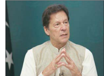
إسلام آباد، «الشرق الأوسط»

أعلن رئيس الوزراء الباكستاني شهباز شريف أن حكم الصادر عن اللجنة الانتخابية في باكستان وبموجب الذي أدين عمران خان حصل على تمويل غير شرعي بملايين الدولارات من الخارج، أثبت مجدداً أن خان «كاذب بارع» في ما يتعلق بتقديم إجابات كاذبة. ونقلت وكالة أنباء «أسوشيتد برس» الباكستانية عن رئيس الوزراء قوله في تغريدة نشرها على موقع «تويتر» بعد إعلان لجنة الانتخابات الباكستانية حكماً صباحاً، أن الحكم الصادر عن اللجنة بخصوص تلقي حزب حركة «الإنصاف» الباكستانية تمويلًا أجنبيًا، جزءاً بسبب «انتهاك الدستور وتقديم إجابات كاذبة وقبول أموال أجنبية». وأضاف: «ثبت من جديد أنه كاذب بارع»، وحض الأمة على التفكير في تداعيات سياسة عمران خان التي يقوم الأجنبي بتمويلها. وكانت لجنة الانتخابات في باكستان، قضت في وقت سابق أمس بتلقي حزب عمران خان أموالاً من شركات أجنبية وأفراد أجنبي، وأخفى أكثر من 12 حساباً مصرفياً. وموجب القوانين الباكستانية، يُمنع على الأحزاب السياسية تلقي أموال أو هبات من شركات أجنبية أو أفراد أجنبي. وأكدت اللجنة أن المعلومات المالية التي قدمها عمران خان «تفتقد إلى الدقة على نحو صارخ»، وفتت حركة «الإنصاف»، هذه الاتهامات، مؤكدة أن الهبات كانت تأتي من باكتانيين مغتربين وليس من غيرهم. وتعود القضية لعام 2014 حين اتهم عضو في الحزب قاده بارتكاب مخالفات مالية. ويرى الخبراء القانونيون أن القضية قد تؤدي إلى تنحي عمران خان الذي اطلع به في أبريل (نيسان) الماضي، بسبب إغفاله الإعلان عن