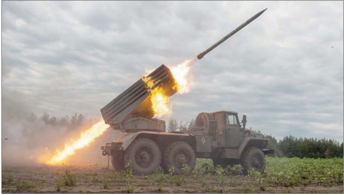
أكد خبراء روس وغربيون أن دخول أنظمة «هيمارس» الأميركية إلى المعركة منح الجانب الأوكراني قدرة على شن هجمات مضادة

لموسكو، رائد جبر اتهمت وزارة الدفاع الروسية الولايات المتحدة بالانخراط «بشكل مباشر» في العمليات العسكرية الدائرة في أوكرانيا، على خلفية معطيات استخباراتية أعلنتها كيف حول التنسيق مع واشنطن في الضربات الصاروخية ضد مواقع الجيش الروسي والانفصاليين الموالين لموسكو.