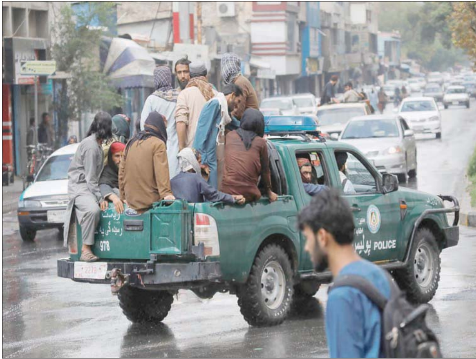
عناصر من «طالبان» في أحد شوارع كابل بعد إعلان مقتل الظواهري بغارة أميركية

مقتل الدكتور أيمن الظواهري، زعيم تنظيم «القاعدة»، بغارة أميركية على مخبئه في كابل، تكون الولايات المتحدة قد أكملت إلى حد كبير انتقامها من القاتمين على هجمات 11 سبتمبر (أيلول) 2001 المنفذين أنفسهم قتلوا في الهجمات الدامية. زعيم «القاعدة»، أسامة بن لادن، قتل بعملية للقوات الخاصة الأميركية ضد مخبئه في ابوت اباد بباكستان، في مايو (أيار) 2011. «العقل المدبر» للهجمات، خالد الشيخ محمد، يقبع في سجن غوانتانامو الأميركي بكيو ما منذ سنوات طويلة، إثر اعتقاله في باكستان. كثير من المحرطين الآخرين يقعون هناك إلى جانبه، أو أنهم قد قتلوا في هجمات أميركية نفذ أكثرها بطائرات دون طيار في مناطق القبائل على الحدود الأفغانية-الباكستانية. ولكن ماذا يعني القضاء على الظواهري؟ يطرح مقتل الظواهري، في الحقيقة، تساؤلات كثيرة. هذا التقرير يحاول الإجابة على بعضها.