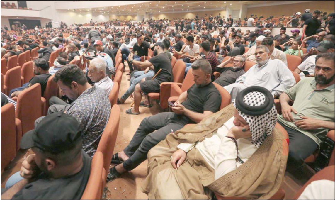
انصار مقتدى الصدر في قاعة اجتماعات البرلمان العراقي أمس (أ.ق.ب)

وكان الكاظمي دعا في بيان له القوى السياسية إلى «عدم الانسحاق نحو الاتهامات، ولغة التخوين، ونصب العدا والكراهية بين الإخوان في الوطن الواحد، والجلوس إلى طاولة حوار وطني؛ للوصول إلى حل سياسي للأزمة الحالية، تحت سقف التآزر العراقي، واليات الحواري الوطني» وأكد الكاظمي أنه «حان الوقت الآن للبحث في البات إطلاق مشروع إصلاحية يتفق عليه مختلف الأطراف الوطنية، وأنا على يقين بأن في العراق ما يكفي من العقلانية، والشجاعة، للمضي بشروع وطني يخرج البلد من أزمة الحالية». وتابع: «يجب على القوى السياسية أن تتحمل مسؤوليتها الوطنية والقانونية، حكومة تصريف الأعمال قامت بكل واجباتها رغم تجاورها