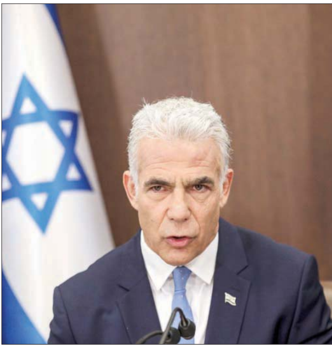
ليبي يتحدث في جلسة للكاينيت الأحد

وفقاً لمصادر أمنية أجنبية، أن إسرائيل تملك ترسانة نووية بالفعل بعد أن تمكنت من حيازة أول قنبلة في أواخر عام 1966. وعادة ما يشير الصحفيون الإسرائيليون، الذين يتقيدون بقيود الرقابة العسكرية، إلى القدرات النووية الإسرائيلية بصورة ضمنية، أو يستشهدون بتقارير الإعلام الخارجي، على سبيل المثال، فإن الرقابة العسكرية الإسرائيلية لم