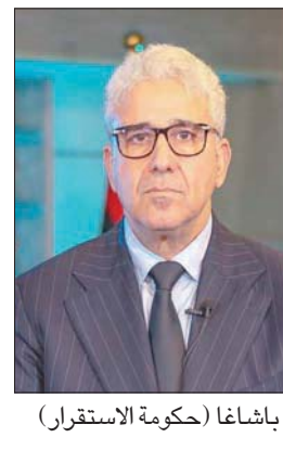
باشاغا (حكومة الاستقار)

وسعت تركيا من قبل إلى عقد لقاء بين الدبية وباشاغا على هامش منتدى انطاليا الدبلوماسية، في مارس الماضي، لكنها لم تنجح في ذلك. ولغث السفير التركي إلى أن بلاده تمتلك علاقات تاريخية،