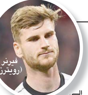
إريكسن مستعد للعب أي أجل النجاح مع يونائيد

لكن تن هاغ يشعر بالرضا عن أداء فريقه في فترة الإعداد، ويرى أن هناك مؤشراً للتحسن، وقال هاغ الذي يستضيف فريقه برايتون في افتتاح مبارياته بالدوري الأحد المقبل: «أعتقد أن فترة الإعداد كانت جيدة وأحرزنا تقدماً ونحن مستعدون للموسم. أعرف أن هناك هامشاً للتحسن ويجب أن نطور، هي عملية مستمرة خلال الموسم، لكن في الأسبوع المقبل نهنم بالانتقال».