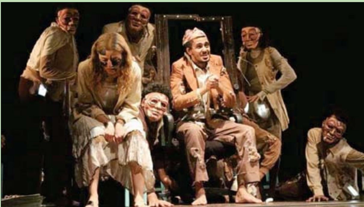
هوس الشهرة يسيطر على الأسرة