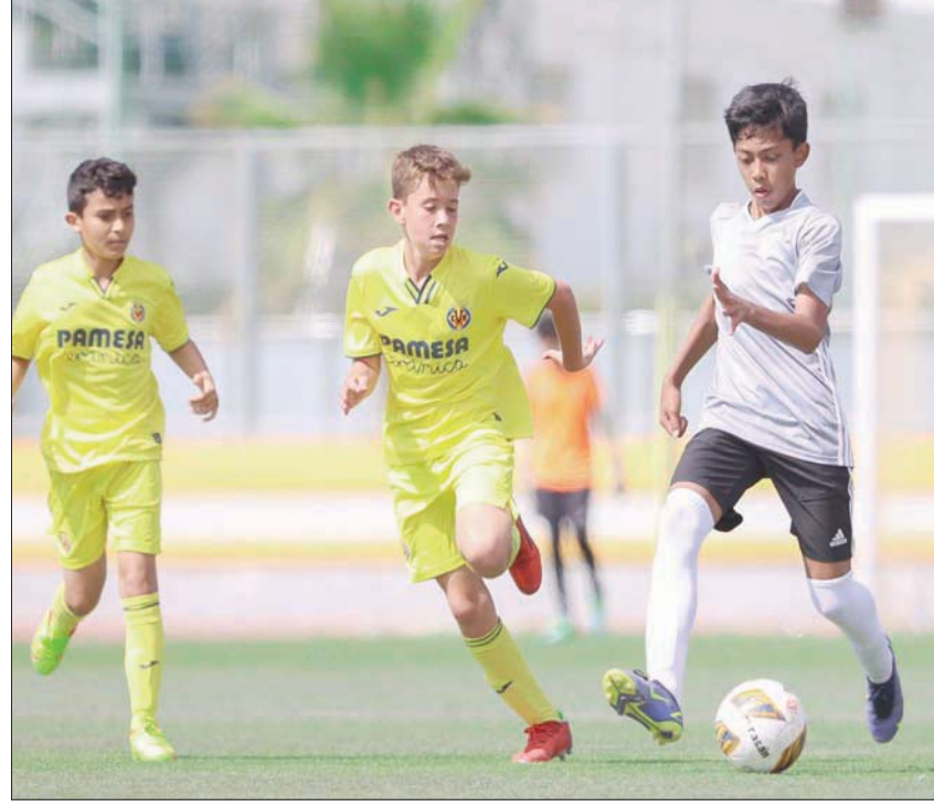
فريق أكاديمية مهد في مواجهة ودية سابقة مع فياريال (الشرق الأوسط)

كرة المضرب. وسيتم إنشاء مبنى للألعاب المختلفة ومبنى لرياضة رمي السهام وفندق سكني خاص للمواهب، وصالة رياضية داخلية وقاعات دراسية ومكاتب للأجهزة الفنية والإدارية وعبادات طبية، وتم اعتماد جميع المنشآت