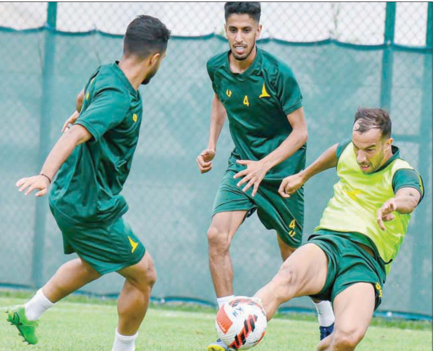
من استعدادات الخليج للموسم الجديد

كما وُجد مدربين من كل فرنسا وكرواتيا، وذلك بعد تعاقد نادي النصر مع المدرب الفرنسي رودي غارسيا، فيما مدد نادي الاتفاق عقد مدربه الفرنسي كارتيرون، أما الكرواتيان البن هورفات مدرب نادي الباطن، وكشمير ريزيتش مدرب نادي ضمك فقد أبقت إدارتا ناديهما