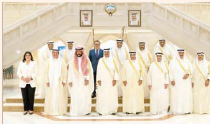
رئيس وأعضاء الحكومة الكويتية الجديدة بعد عقد أول اجتماع لهم أمس

المعارضة والسذي يتهم بعرقلة الإصلاحات الاقتصادية. وقال بيان صادر عن الديوان الإميري الكويتي، أمس إن ذلك يأتي تصحيحاً للمشهد السياسي وما فيه من عدم توافق وعدم تعاون واختلافات وصراعات وتغليب المصالح الشخصية. وأضاف: «وبناء على عرض رئيس مجلس الوزراء وبعد موافقة مجلس الوزراء... يُحل مجلس الأمة، وعلى رئيس مجلس الوزراء