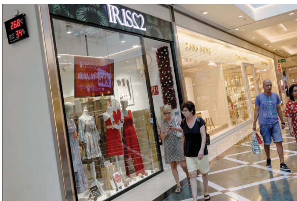
أشخاص يسيرون بالقرب من مقياس حرارة يعرض درجة 26,8 درجة مئوية في مركز تسوق بمدريد

المالي يشمل كذلك تقليل الانبعاثات الكربونية في الشبكات الحالية، فضلاً عن استغلال الحرارة المهدرة الناتجة، على سبيل المثال، من المنشآت الصناعية. تجدر الإشارة إلى أن شبكات التدفئة تقوم بتدفئة المباني من خلال توزيع مياه ساخنة عبر أنابيب معزولة، ويمكن تشغيلها بعدة طرق من بينها توليد الكهرباء في محطات الطاقة. وذكرت المفوضية أنه من المتوقع أن تنجح الخطة على مستوى ألمانيا في تقليل انبعاثات الغازات المسببة للاحتباس الحراري بما يقرب من أربعة ملايين طن من ثاني أكسيد الكربون. وتغطي الخطة تكاليف دراسات الجدوى بنسب تصل إلى 50 في المائة ودعم المشغلين لإقامة الأنظمة بما يصل إلى 40 في المائة عندما تكون المقترحات مؤهلة للحصول على دعم. ومن المحتمل أن يستمر عمل آخر ثلاثة مفاعلات نووية في ألمانيا خلال الشتاء المقبل، رغم أنه من المفترض أن يتم إغلاق هذه المفاعلات بشكل نهائي بحلول نهاية العام. جاء ذلك وفقاً لما نقلته وكالة