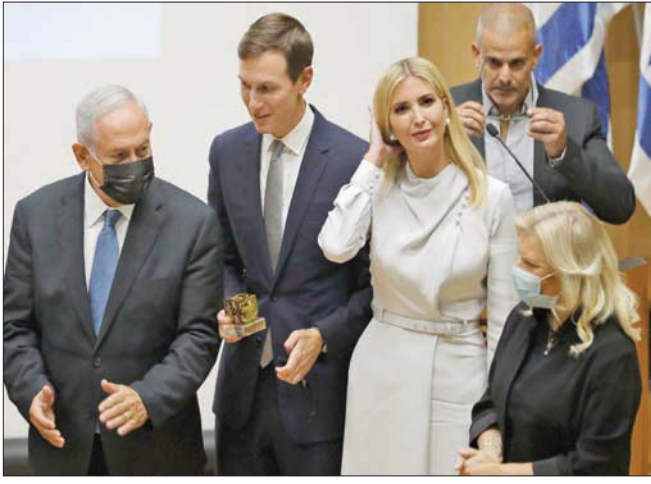
كوشنر وزوجته إيفانكا يتوسطان بنيامين نتانياهو وزوجته سارة في زيارة للكنيست أكتوبر 2021

في حينها انفتاحاً على تطبيع العلاقات مع إسرائيل»، بحسب كوشنر. ومن خلال السماح للفلسطينيين باستخدام حق النقض ضد الخطة بالكامل، سار ترمب عكس فكرة أن رفض الفلسطينيين سيكشف عن تعنتهم الأمر الذي يخدم موقف إسرائيل، وفي «تطور غير متوقع، لكنه إيجابي»، رفض عباس تلقي مكالمة من ترمب، قائلاً إنه لن يتحدث إلى الرئيس إلا بعد إعلان خطة السلام. بعد ذلك، قطع كوشنر، الذي كان