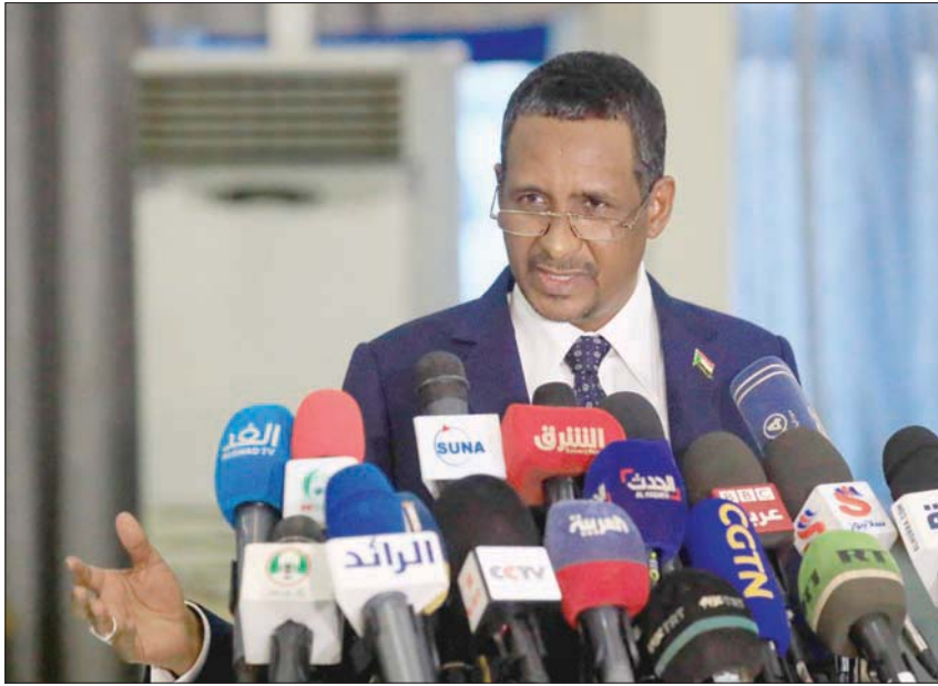
نائب رئيس مجلس السيادة السوداني محمد حمدان دقلو «حميدتي»

وفي مقابلة مع «بي بي سي» العربية، أول من أمس، أقر قائد قوات الدعم السريع «شبه النظامية» محمد حمدان دقلو «حميدتي»، بفشل إجراءات الجيش التي اتخذها في 25 أكتوبر (تشرين الأول) 2021 في تحقيق أهدافها، وهي الإجراءات التي اعتبرتها القوى السياسية السودانية والحراك المدني «انقلاباً عسكرياً» أطاح حكومة رئيس الوزراء عبد الله حمدوك الانتقالية. وقال استاذ العلاقات الدولية