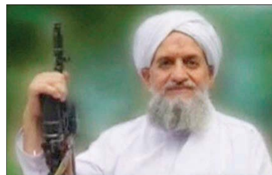
الظواهري في صورة من الأرشيف

وفقا لمجلس العلاقات الخارجية الأميركي ويروي الباحث في شؤون الجماعات الإسلامية ماهر فرغلي أن «جماعة أنصار السنة المحمدية، هي التي شكلت فكر الظواهري الجهادي، منذ نشأته». ويقول لـ«الشرق الأوسط» إن «هذه الجماعة كان لها أكبر الأثر في حياة الظواهري في ما بعد». عجب الظواهري بأفكار سيد قطب، وكان يستشهد بها في كتاباته، وبعد إعدام الأخير في 1966، ساعد مع أربعة طلاب في تشكيل خلية سرية بهدف قلب نظام الحكم وإقامة دولة إسلامية». ويقول العميد خالد عكاشة، مدير المركز المصري للفكر والدراسات الاستراتيجية، إن «انضمام الظواهري لتنظيم الإخوان كان من أهم المحطات التي شكلت فكره في ما بعد، حيث اعتنق الفكر التنظيمي المسلح»، عجب الظواهري بأفكار سيد قطب، وكان يستشهد بها في كتاباته، وبعد إعدام الأخير في 1966، ساعد مع أربعة طلاب في تشكيل خلية سرية بهدف قلب نظام الحكم وإقامة دولة إسلامية». ويقول العميد خالد عكاشة، مدير المركز المصري للفكر والدراسات الاستراتيجية، إن «انضمام الظواهري لتنظيم الإخوان كان من أهم المحطات التي شكلت فكره في ما بعد، حيث اعتنق الفكر التنظيمي المسلح»،