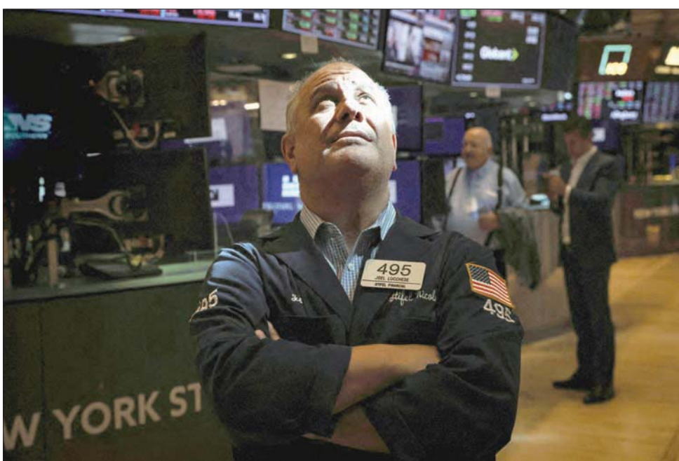
طغت رهبة زيارة نانسي بيلوسي إلى تايوان على غيرها في تعاملات الأسواق العالمية أمس (رويترز)

سهما على المؤشر نيكي مقابل تراجع 206. ومن جانبه، تخطى الذهب عن مكاسبه التي سجلها في أوائل المعاملات ليختم تداوله دون تغيير يذكر يوم الثلاثاء مع ارتفاع الدولار الأميركي، وأبقى انخفاض عوائد سندات الخزنة والمخاوف المتزايدة من الركود المعدن الأصفر قرب ذروته في أربعة أسابيع. واستقر الذهب في المعاملات الفورية عند نحو 1771,29 دولار للأونصة (الأونصة بحلول الساعة 08:43 بتوقيت غرينيتش، بعد أن سجل أعلى مستوياته منذ الخامس من يوليو (تموز) في وقت سابق من الجلسة عند 1780,39 دولار. وفي العقود الأجلة الأميركية لم يطرأ تغيير على سعر الذهب ليسجل 1787,10 دولار للأونصة. وقال جيفاني ستونوفو المحلل لدى يو بي إس إن انخفاض أسعار الفائدة الحقيقية في الولايات المتحدة دعم الذهب في الأونة الأخيرة. ومع ذلك، قال ستونوفو إن زيادة أكبر في أسعار الفائدة من قبل مجلس الاحتياطي الفيدرالي الأميركي وتراجع التضخم سيؤثران على الأسعار خلال الأشهر الستة المقبلة. وبلغت عائدات سندات الخزنة