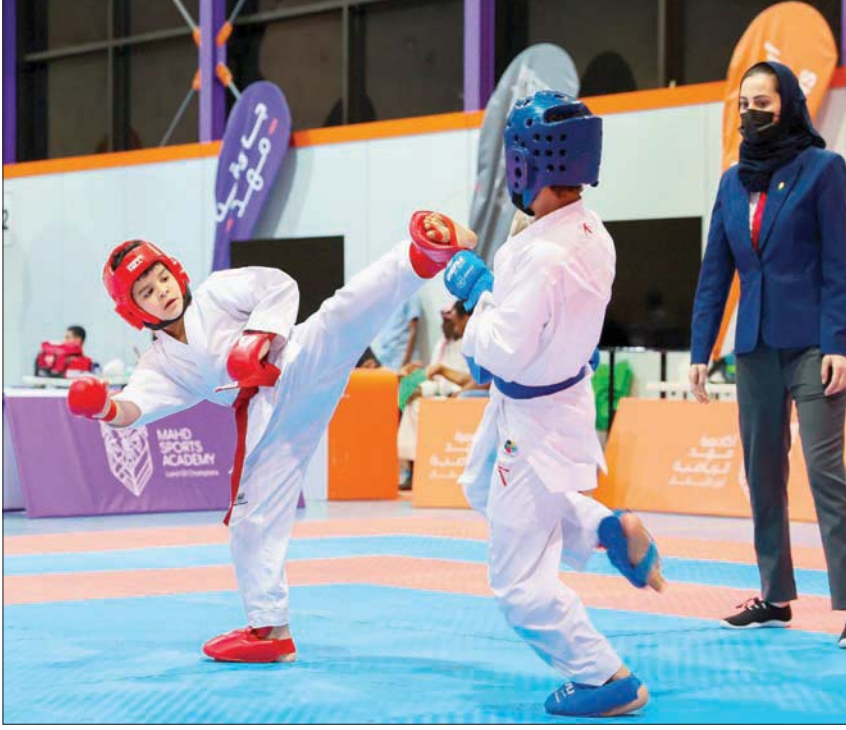
الأكاديمية منحت اهتماماً بالغا لمواهب الألعاب القتالية للصغار

وفي نهاية البرنامج تم اختيار 45 لاعباً، هم النخبة وباكورة أجيال أكاديمية «مهد»، وسميتون «مهد» في السنوات القادمة، وتمت مراعاة العنصر الفني والبدني والذهني لهم وبناء خصائص مختلفة فيهم مثل روح الفريق والمحفزات والشخصية. الجدير بالذكر أن «مهد» وقّعت عدة شراكات عالمية هي الأولى من نوعها في المملكة مع الاتحاد الأوروبي لكرة القدم (UEFA)، والاتحاد الفرنسي لكرة القدم، والاتحاد الفرنسي لكرة اليد، والمركز الوطني الفرنسي للرياضة والخبرة والإداء (INSEP)، بهدف رفع القيمة الفنية للاكاديمية وتبادل الخبرات وتمكين الأكاديمية من إعداد المواهب بشكل احترافي، كما انضم لـ«مهد» مدربون عالميون مثل جوزيه مورينهو وروبيرتو مانشيني كسفراء لأكاديمية «مهد» لتطوير الكفاءات الوطنية.