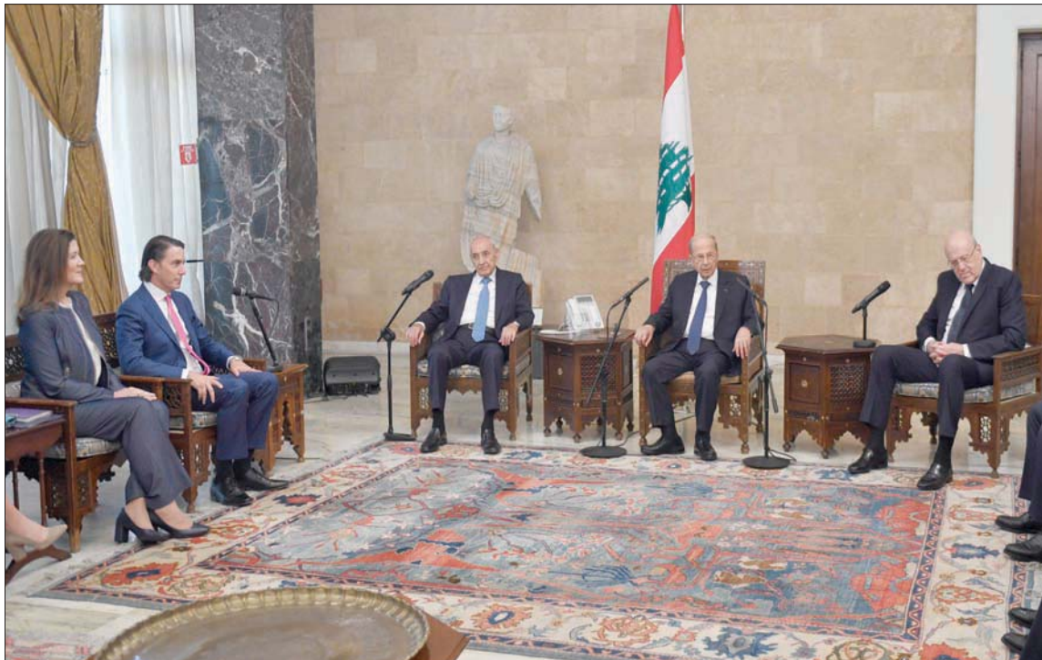
عون وبيري وميقاتي خلال اجتماعهم مع هوكستين بحضور السفارة دورتي شيا

وبيروت، «الشرق الأوسط» شوّش «حزب الله» على الإيجابية التي ظلتت لقاءات الوسيط الأميركي لمفاوضات ترسيم الحدود البحرية مع إسرائيل أموس هوكستين في بيروت أمس، حيث هاجم الحزب الولايات المتحدة، واتهمها بمنع لبنان من استخراج النفط والغاز طوال 12 عاماً، والضغط على الشركات الأوروبية لوقف التنقيب في المياه الاقتصادية اللبنانية.