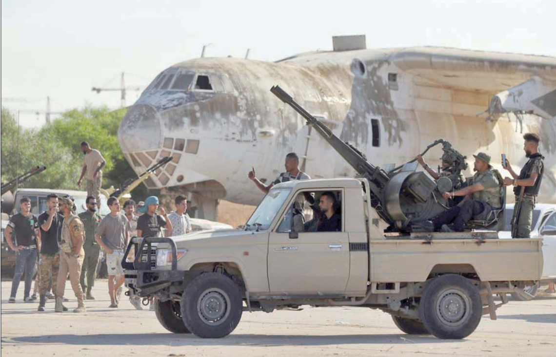
جانب من التحشيدات العسكرية لقوات موالية لحكومة الدبية قرب مطار طرابلس

مؤكد أن الهدف من هذا الجهاز هو دعم منطقة الهلال النفطي، وتقديم خدمات استثنائية لها، وفق الإجراءات القانونية المعمدة.