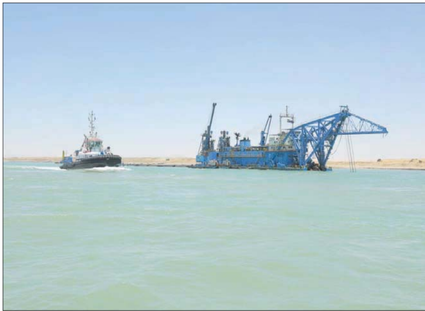
من قطع البحرية التابعة لأسطول هيئة قناة السويس

العام الميلادي 2022 سجلت 704 ملايين دولار مقابل 531,8 مليون دولار خلال شهر يوليو من العام الماضي بفارق 172,2 مليون دولار، وبنسبة زيادة قدرها 32,4 في المائة». وأشار رئيس الهيئة إلى