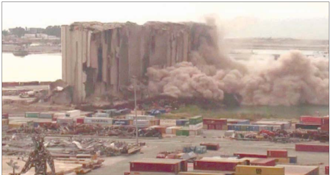
الغبار يتصاعد من ركام جزء من الأهرامات في مرفأ بيروت بعد انهياره

الشرقية من الأهرامات، التي لم تتعالج لخطورة الوصول إليها، تقدر بحوالي 3000 طن، منها 800 طن بدأت بالاحتراق الذاتي أخيراً نتيجة العوامل المناخية. إذ تصل حرارة الحبوب إلى أكثر من 95 درجة مئوية نتيجة التخمر، علماً بان الانبعاثات الناتجة عن هذا التخمر لا تشكل أي خطر على الصحة العامة». ويقدر الخبراء أن المخزون من استعمال المياه لإخمادها، ما يقام الوضع، ويزيد من عمليات التخمر والاحتراق.