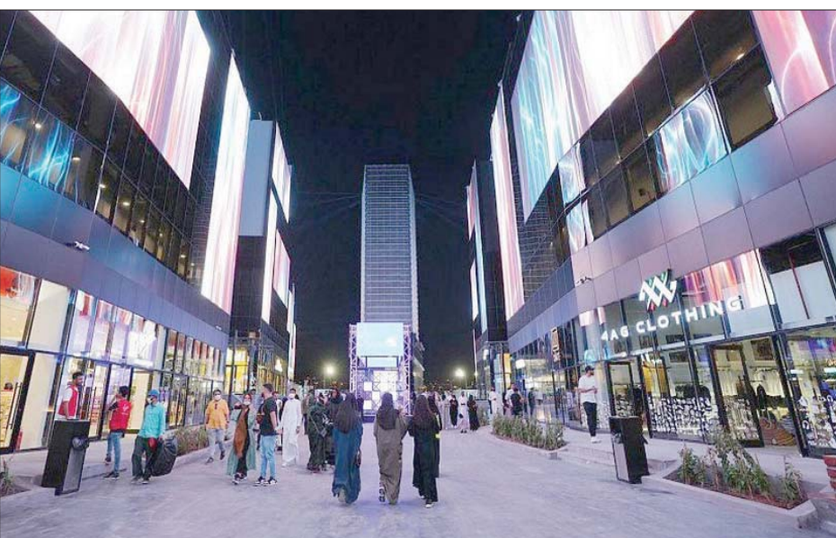
يعد الترفيه من القطاعات التي ساهمت في رفع دخول المنشآت الصغيرة والمتوسطة إلى السوق السعودية (الشرق الأوسط)

وأوضح التقرير عن أهم الإحصاءات المتعلقة بالقطاع، إذ تلقت المنشآت الصغيرة والمتوسطة التمويلية التي صممتها «مشتات»، لتحصل على مبلغ 64,6 مليار ريال (17,2 مليار دولار) من خلال برنامج «كفالة» الذي يضمن قروض البنوك للمنشآت الصغيرة والمتوسطة، كما حصلت على تسهيلات تمويلية بقيمة 12,3 مليار ريال (3,2 مليار دولار) من خلال بوابة التمويل.