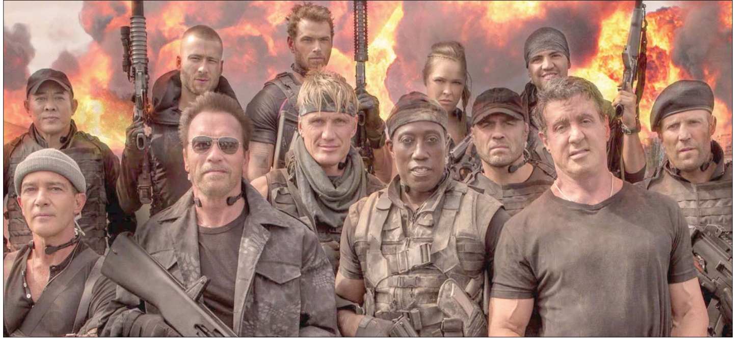
سلفستور ستالون (يمين) وشوارتزنيغر (الثاني من اليسار) في «المستهلكون»