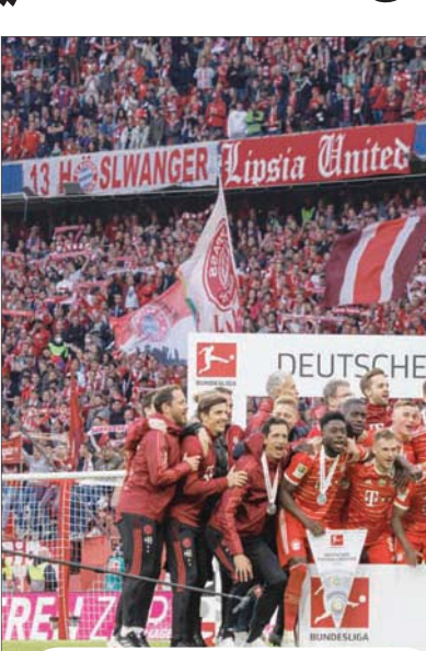
لاعب بايرن ميونخ ما زالوا المرشحين الأبرز للحفاظ على اللقب للمرة الحادية عشرة توالياً

مسؤولي بايرن ميونخ بشر «أكاذيب» حوله، وتبادل اللاعب البالغ عمره 33 عاماً وإدارة النادي الانتقادات بشأن طريقة التعامل مع الصقفة، ما أثار استياء حسن صالح محمديتش، مدير الكرة للنادي البافاري، وأوليفر كان، الرئيس التنفيذي للنادي؛ لكنهما علنا أنه جرى تسوية الخلافات وتعد هناك أي مشاعر سلبية بين الطرفين.