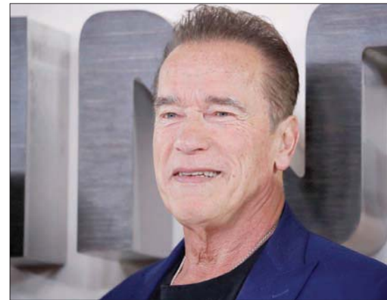
الممثل النمساوي الأمريكي آرنولد شوارتزنيغر