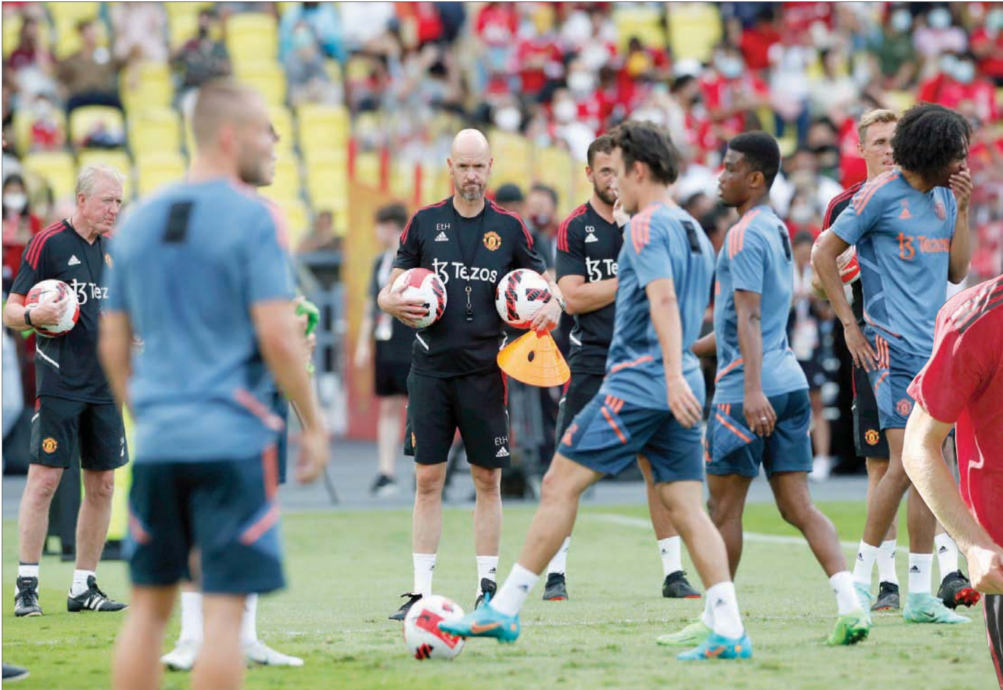
تن هاغ مدرب يونائيد الجديد يعقد آمالاً على الشباب لإحداث التغيير (إب1)

الأرجنتيني ليساندرو مارتينيز والهولندي تايرل مالاسيا، بعد أن استقبل يونائيد 57 هدفاً في الموسم الماضي وهو أكبر عدد بين الستة الكبار في الدوري، لكن توجد مراكز أخرى مهمة، وربما يكون التعاقد مع إريكسن حلاً لبعض مشاكل خط الوسط، حيث يجيد النجم الدنماركي لعب دور صانع الهجمات، لكن ما زال الفريق لا يملك إلا خيارات دفاعية قليلة بخط الوسط. وكان حديث وسائل الإعلام البريطانية منذ أشهر عن يونائيد ينصب حول اهتمام الأخير بضم لاعب وسط برشلونة الهولندي فرنكي دي يونغ لكن لم يتم التوصل لاتفاق حتى الآن. كما يبقى مستقبل كريستيانو رونالدو، هدف الفريق في الموسم الماضي، معلقاً أيضاً حيث يرغب النجم البرتغالي المخضرم في الرجوع لناد آخر مشارك في دوري الأبطال، لكن يونائيد يرفض بيعه. وغاب رونالدو عن رحلة الفريق إلى تايلاند واستراليا لأسباب عائلية، قبل مشاركة في المباراة التجريبية الأخيرة مع صيفه رايو فايكانو الإسباني (1-1) الأحد على ملعب «أولد ترافورد».