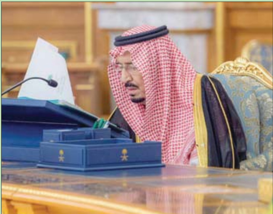
خادم الحرمين الشريفين مترئساً جلسة مجلس الوزراء (واس)

المدني، أو من ينيبه، بالتباحث مع الجانب الفرنسي في شأن مشروع الترتيبات الفنية في مجال الطيران المدني بين الهيئة العامة للطيران المدني في السعودية ووزارة النقل في فرنسا.