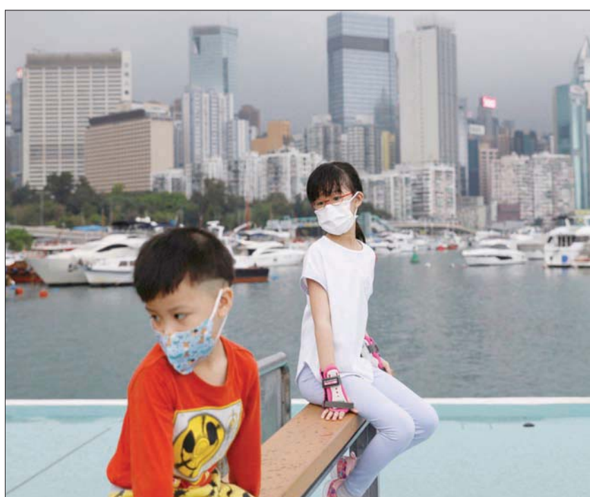
أطفال يرتدون أقنعة للوجه أثناء اللعب بجوار ميناء فيكتوريا في هونغ كونغ مارس الماضي

مجرد إصابتك بنزلات البرد من أطفالك لا يعني أنك أو أنهم لن يصابوا بـ«كوفيد-19»، وقال إن التطعيم يبقى أفضل حماية. وأضاف: «إنجاب الأطفال الصغار لا يمنح الحماية المطلقة، دراستنا توحى فقط بهذا التأثير، وهذه قطعة صغيرة من أحجية كبيرة جداً يعمل العلماء على حلها، وهي: لماذا يصاب بعض الأشخاص بـ«كوفيد-19» بشكل سيئ للغاية، والبعض الآخر لا يصاب به، وهذه مجرد قطعة