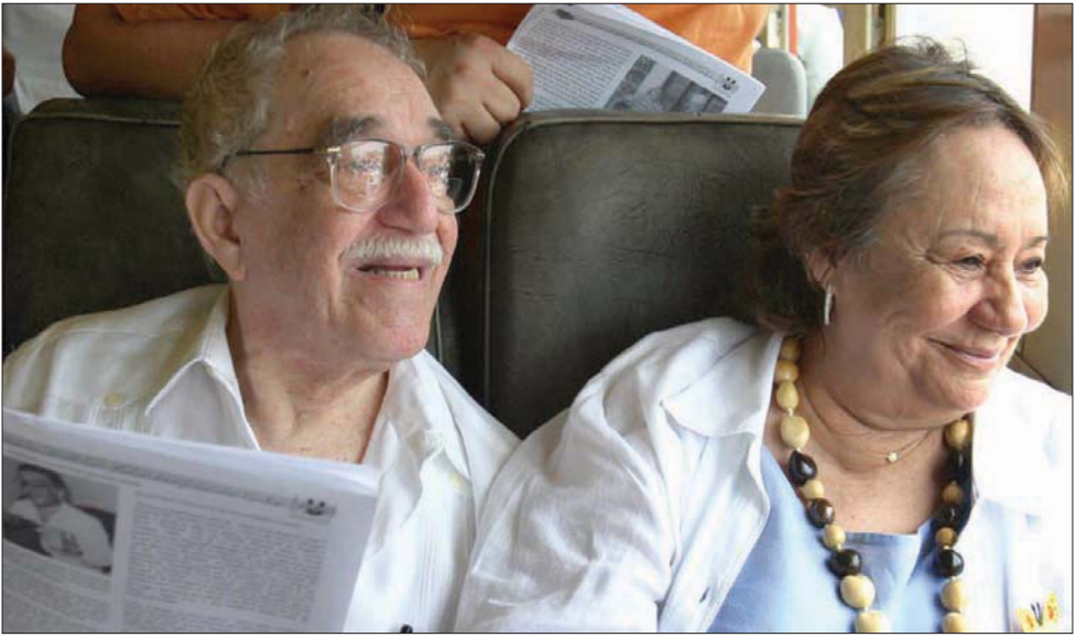
مرسيدس بارشا وغارسيا ماركيز

استوحى من المغامرة العاطفية المؤثرة لأمه وأبيه، ورائعته الروائية الأخرى «الحب في زمن الكوليرا». إلا أن المتابعين الكثر لأعمال ماركيز، والمتعطفين للاطلاع على سيرته الشخصية وخفايا حياته، لن يجدوا في مذكراته الصادرة عام 2002 في جزأين اثنين، ما يرضي فضولهم للوقوف على حياته العاطفية ومغامراته المختلفة مع النساء. وبدلاً من ذلك يطعننا المؤلف على كتابه الأثيرين، وعلى انخراطه بإفعا في العمل الصحافي، حيث تنقل بين «الليونفيسرسال» و«هيرالدو» و«السيكيتادور»، وعلى أعماله الأولى التي كلفه نشرها الكثير من المشقات والتعديلات المتواصلة. ولعل أطرف ما يرويه الكاتب الكولومبي المعروف بأسلوبه الساخر، هو