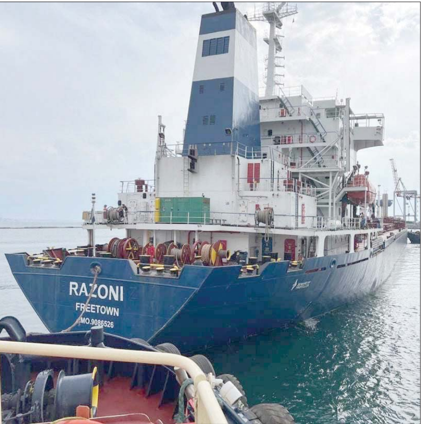
السفينة «رازوني» المحملة بالحبوب لدى مغادرتها ميناء أوديسا الأوكراني

وأشار أردوغان إلى أن الجميع يقر بأن الخطوة التي تم اتخاذها دبلوماسياً مهماً في سبيل تجاوز أزمة الحبوب، التي يتابعها العالم عن كثب، هي بالكامل ثمرة للجهود الحثيثة التي بذلتها تركيا في هذا الخصوص، وأن الأمين العام للأمم المتحدة أنطونيو غوتيريش أعرب عن إعجابها بتفكيرها في جهودها في هذا الصدد عند مغادرة أول سفينة محملة بالحبوب ميناء أوديسا الأوكراني عقب إبرام اتفاقية إسطنبول.