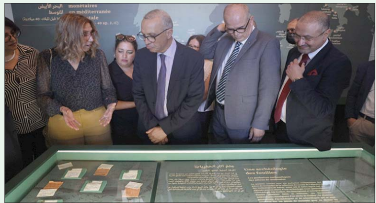
وكيل وزارة الثقافة المغربية لدى افتتاحه المعرض أخيراً

ديسمبر (كانون الأول) المقبل، من خلال وصله بين مجموعة من الروابط والمواقف والحظوظ التحولات والمفارقات التاريخية، مشكلاً من الصور حول النقود.