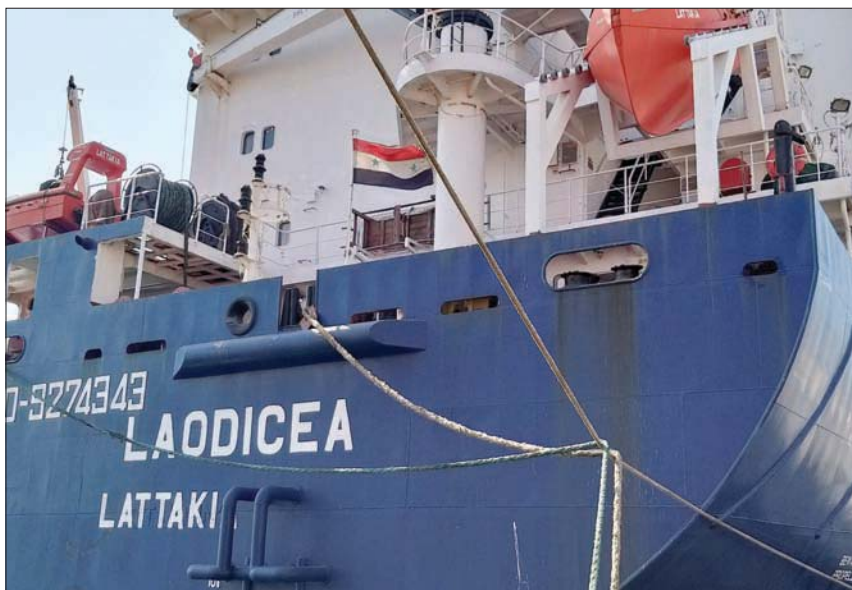
السفينة التي تحمل العلم السوري راسية في مرفأ طرابلس