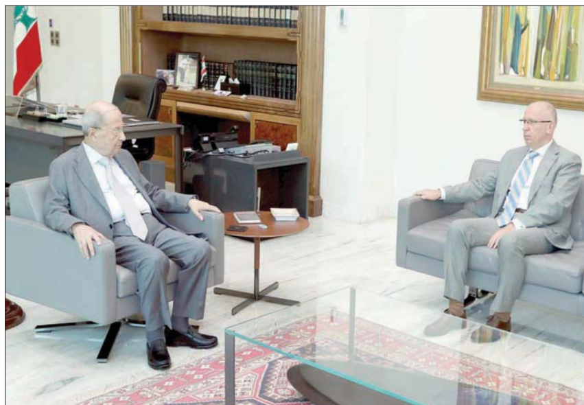
الرئيس عون مستقبلاً سفير أوكرانيا الذي أبلغه أن مواد السفينة «سروقت» من بلاده

روسيا في الأونة الأخيرة، فيما نفى مسؤول في شركة لتجارة حبوب مقرها تركيا، أمس، أن تكون شحنات الشعير والدقيق على متن سفينة ترسو في ميناء لبناني قد سُرقَت من أوكرانيا قائلاً إن مصدر الدقيق هو روسيا.