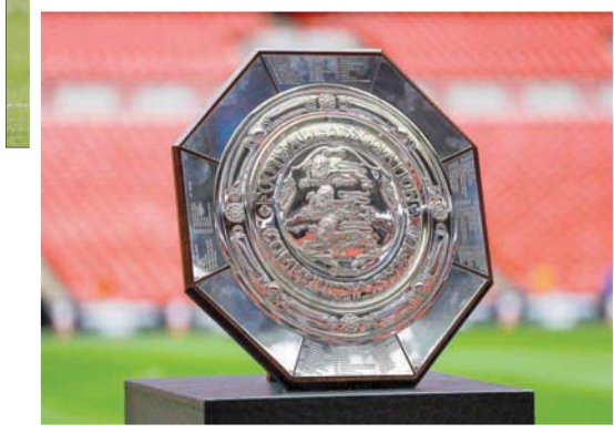
مباراة درع المجتمع ستكشف مدى جاهزية ليفربول ومانشستر سيتي للموسم الجديد اليوم (الشرق الأوسط)

وتابع: «خلال الأعوام الماضية (هم) كانوا يفقدون مهاجم، لذلك بالطبع كنت أرى نفسي في مثل هذه المواقف. لست مندشاً. الجودة جيدة».