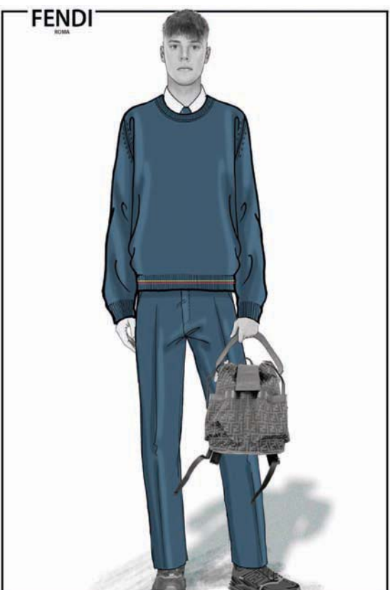
اللاعب نيكولا زالنسكي في قطع منفصلة من المجموعة الأولى

ملف العلاقة بين كرة القدم وصناعة الموضة، التي مرت بعدة توترات أقرب إلى العداوة قبل أن تتوطد في العقدين الأخيرين فقط. فإلى حد التسعينيات القرن الماضي، كانت الأولى شعبية والثانية نخوية. كانت بيوت الأزياء الكبيرة تخوف من أي خيط يمكن أن يربطها بجماهير كرة القدم لما كان لشعبهم من تأثير سلبي على صورتها وسمعتها. فدار «بيريري» كادت أن تتعرض للإفلاس بسبب إقبالهم على منتجاتها.