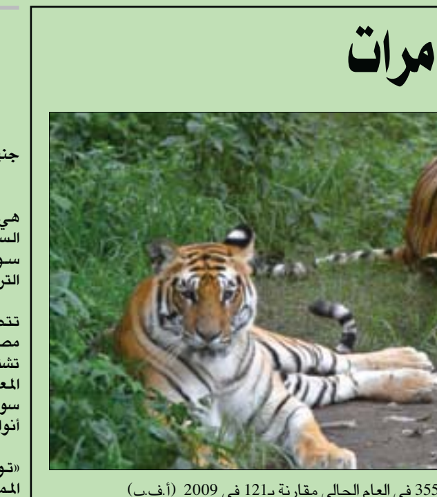
زاد عدد النمرور في نيبال إلى 355 في العام الحالي مقارنة بـ 121 في 2009

عامي 1986 و2020 تجاوزت التكلفة الإجمالية لغزو الزواحف والبرمائيات 17 مليار دولار، منها 6,3 مليار دولار تكلفة غزوات البرمائيات، و4,4 مليار دولار تكلفة الغزوات التي شملت كلاً من البرمائيات والزواحف. وتم إرجاع 96,3 في المائة (6 مليارات دولار) من التكاليف الاقتصادية الناتجة عن غزو هذا النوع، بينما تكبدت دول أوقيانوسيا وجزر المحيط الهادئ