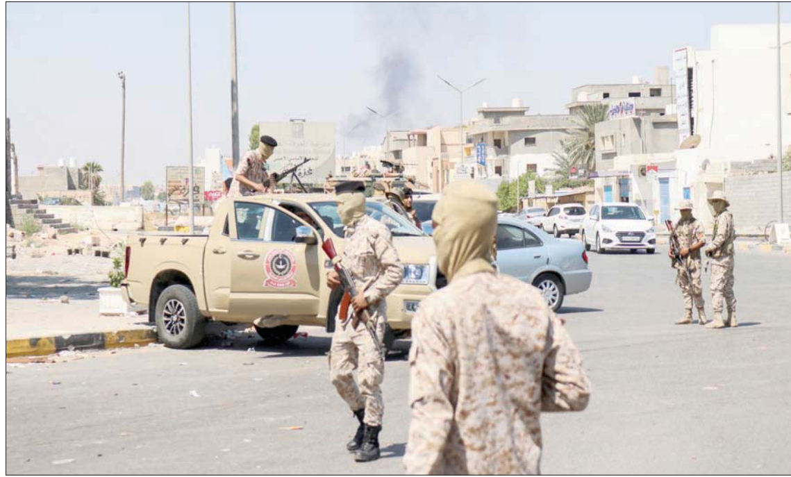
جانب من الحشود العسكرية في طرابلس

في أن يؤدي الاجتماع الثاني مع الجوليبي خلال الساعات المقبلة، إلى اتفاق يجنب طرابلس ويلات الحرب، لافتاً إلى أن «تردي الوضع الأمني في طرابلس والاحتقان السياسي»، سيكونان أبرز بنود هذا الاجتماع. من جهته، أنهى المبعوث الأميركي الخاص والسفير لدى ليبيا ريتشارد نورلاند، زيارة إلى العاصمة طرابلس، وقال إنه تحدث خلالها مع نظرائه الليبيين حول «أهمية الحفاظ على الاستقرار والأمن في ضوء الاشتباكات الأخيرة التي أسفرت عن مقتل 16 ليبيا»، وشدد على «أهمية وضع المسلمات الأخيرة على التوافق على قاعدة دستورية للانتخابات الرئاسية والبرلمانية، كخطوة حيوية لإرساء الشرعية الكاملة للحكومة الليبية». وقال في بيان وزعته السفارة الأميركية إن بلاده تواصل دعم الغالبية العظمى من الليبيين «الذين يتوقعون انتخابات ويطالبون بحماسة قادتهم»، لافتاً إلى أنه «لحسن الحظ، تجنبت ليبيا صراعاً أوسع نطاقاً بعد الاشتباكات المسلحة في طرابلس ومصبراتة». وتابع «قبل عام استخدمت مثلاً في وصف أهمية الإسراع في تأسيس قاعدة