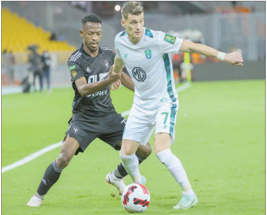
دوري الأولى سيشهد عدداً من التوقعات بسبب الأهلي والفيصلي

عن دورة الألعاب السعودية قبل أكثر من عامين، وتم تأجيلها بسبب جائحة كورونا التي تجاوزناها بنجاح ولله الحمد بفضل من الله