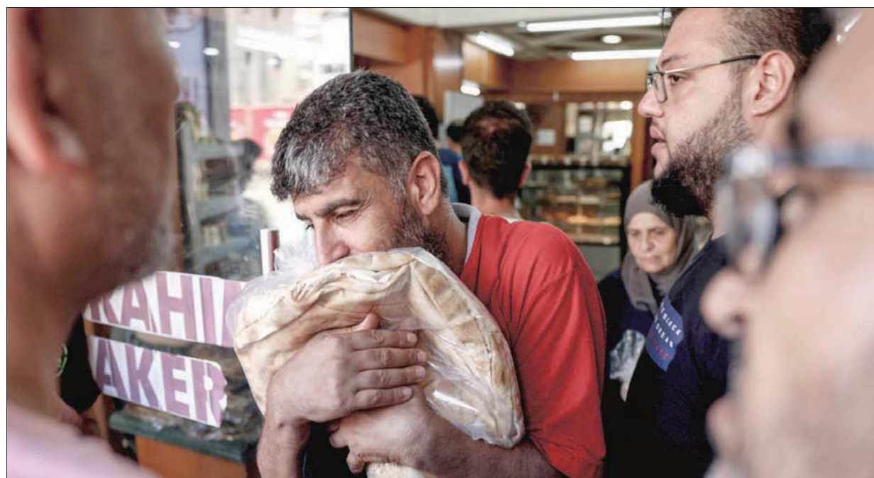
تفخره السعادة بعد حصوله على رطله خبز في بيروت

اللبنانيون واللاجئون في الطوابير أمام الأفران للحصول على رطله الخبز، ما أدى إلى تسجيل إشكالات بين الطرفين، فيما عمدت بعض الأفران إلى رفض بيع الخبز للسوريين.