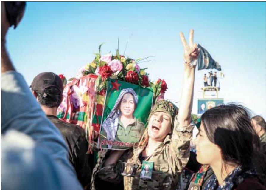
مقاتلات كرديات يشاركن في جنازة زميلات لهن قتلن بغارة تركية قبل أيام