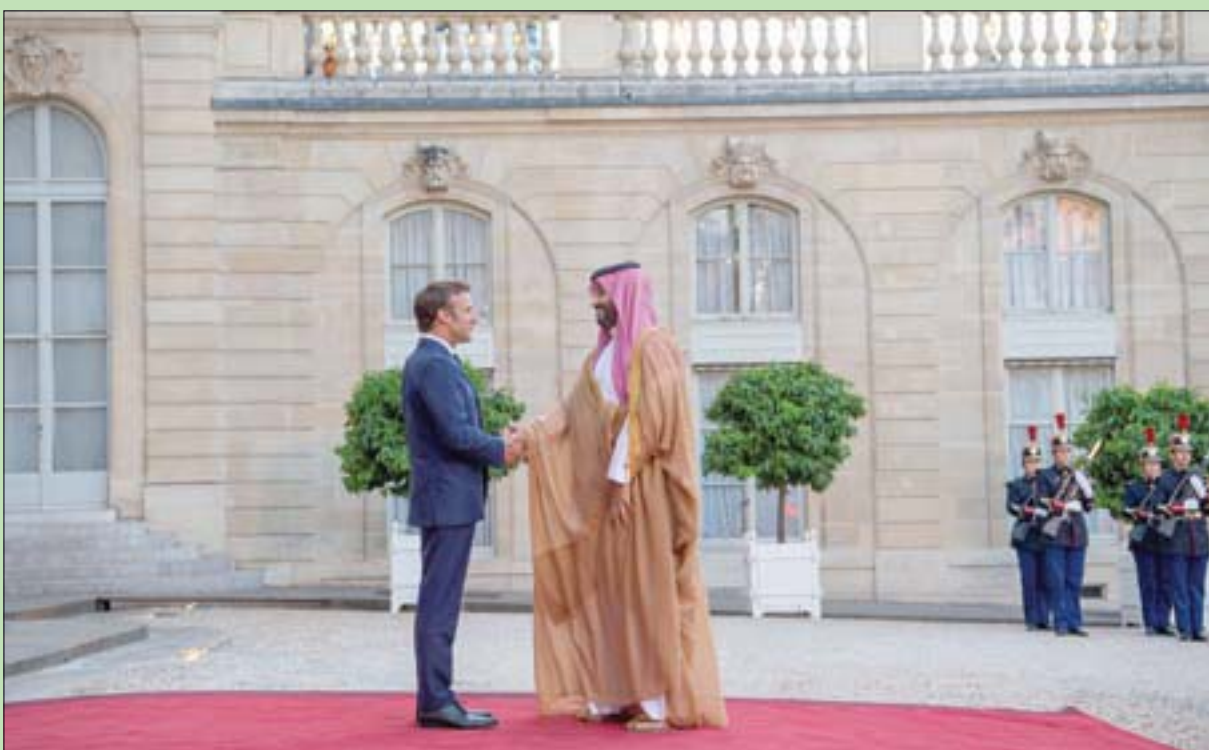
الرئيس الفرنسي لدى استقباله ولي العهد السعودي في قصر إيليزيه الخميس

وفي ختام الزيارة أعرب الأمير محمد بن سلمان ولي العهد السعودي عن شكره وتقديره للرئيس الفرنسي إيمانويل ماكرون على ما حظي به والوفد المرافق له من حسن الاستقبال وكرم الضيافة. ومن جانبه أعرب رئيس فرنسا عن أطيب تمنياته بالصحة والسعادة للأمير محمد بن سلمان، وبالجزيرة من التقدم والرفق لشعب المملكة الصديق. وكان البيان الختامي