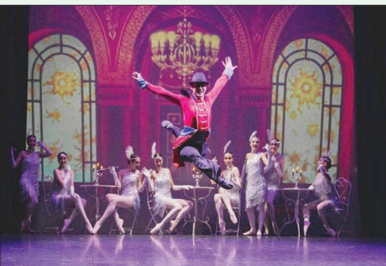
الإضاءة تأخذ عين المتفرج وتركيزه إلى حيث الأماكن التي تريد أن تأخذه إليها

«فندي» تدخل في شراكة مع «إيه إس روما» لتضفي على الفريق أناقة