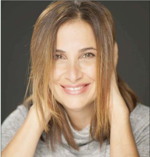
الفنانة فرح بسيسو

القاهرة، داليا ماهر تمت الفنانة الفلسطينية فرح بسيسو تقديم عمل مسرحي (بخطفها) من عشق التلفزيون والسينما، وتنتظر بسيسو عرض مسلسلها (مو) الشهر المقبل عبر منصة (نتفليكس)، وتقول في حوارها «فخورة بعودتها الفنية بعد فترة غياب من خلال فيلم (بنات عبد الرحمن) الذي عرض في عدد من المهرجانات الدولية، كان آخرها مهرجان عمان في دورته الثالثة، بجانب طرحه في دور العرض السينمائية في السعودية أخيراً».