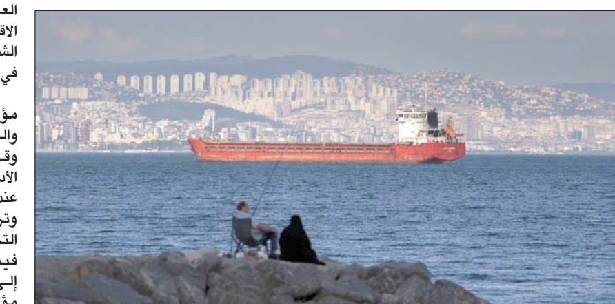
عدد الزوار الأجانب الذين وصلوا إلى تركيا قفز بنسبة 145 في المائة مقارنة بالعام السابق

مليون شخص، في وتيرة تتوافق تقريباً مع مستويات ما قبل الجائحة عام 2019.