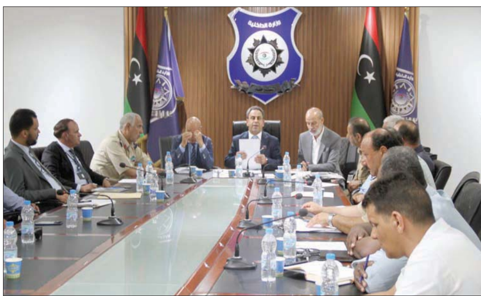
اللجنة الوزارية الليبية المكلفة إعادة تشغيل معبر غدامس الحدودي مع الجزائر (وزارة الداخلية في حكومة الوحدة)

ومبكراً سعى مجلس النواب الليبي للعمل على إعادة حركة المواطنين بين البلدين، وهو ما انعكس على مباحثات سبق وإجرائها النائب الأول لرئيس المجلس فوزي النوييري، مع سفير الجزائر لدى ليبيا سليمان شنين. وقال النوييري، في حينها، إنه ناقش مع شنين، سبل «العمل على دعم توطيد العلاقات بين البلدين، والحث على تسهيل إجراءات التنقل بينهما». ويعد معبر غدامس قرابة 20 كيلومتراً.