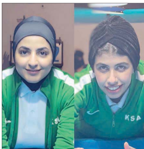
الألعاب الموهوبات يلقي اهتماماً متواصلًا من اتحاد اللعبة (الشرق الأوسط)

سيكون له نصب وافر في تحقيق مركز جيد في بطولة العالم للناشئين حيث يعرف إمكانات هذا اللاعب وقدرته على مقارعة اللاعبين البارزين على مستوى العالم معبراً عن ارتياحه من التطور الكبير والإقبال الواسع على اللعبة من قبل السعوديين من الرجال والسيدات خلال فترة توليه القيادة الفنية للمنتخب منذ (4) أشهر.