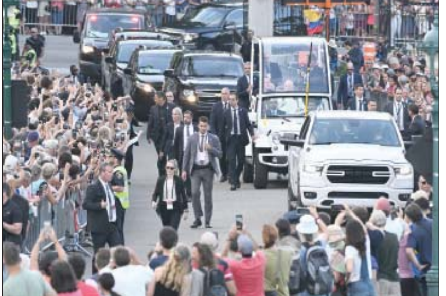
جانب من زيارة البابا إلى كيبك في 27 يوليو

الهاثفي كان صريحاً وعميقاً». من جانبه، أكد البيت الأبيض، في بيانه، أنه «على صعيد تايوان، شدد الرئيس بايدن على أن سياسة الولايات المتحدة لم تتغير، وأنها تعارض بقوة الجهود الأحادية لتغيير الوضع القائم أو تقويض السلام والاستقرار في مضيق تايوان». وقلقت المسؤولة الأميركية الرفيعة، في تصريحاتها للصحافيين، من مخاطر زيارة بيلوسي لتايوان، وشددت على الطبيعة الإيجابية للنقاشات التي جرت بين الزعيمين. وقالت إن المحادثات تطرقت إلى التغيير المناخي، والأمن الصحي، ومكافحة المخدرات، و«فضية المواطنين الأميركيين المحترزين للعلماء في