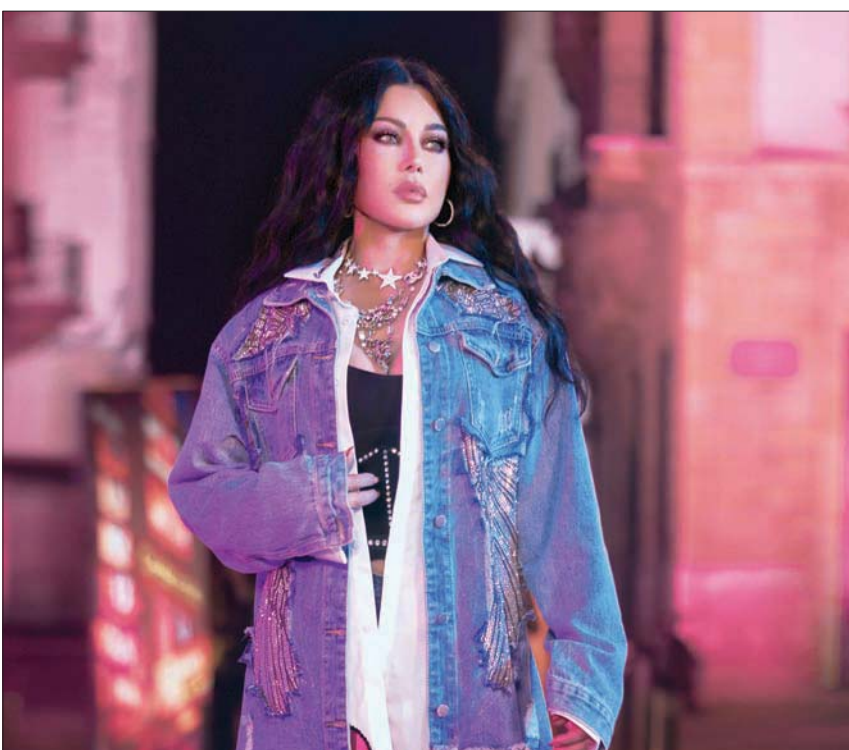
حصدت أغنية «تيجي» حتى اليوم نحو 14 مليون مشاهدة

في مصرف أو في دائرة رسمية كي اتقوقع وأؤدي عملي كفرض واجب. ولذلك علي دائماً أن أبحث عن الأفضل وأن أجتهد، فأحلامي أحققها على طريقي ولو استغرق الأمر بعض الوقت. وهذا ما يمكنك لسه في عمالي أكثر من مشهد منه. فهو من ينفذ يحفر في ذاكرة المشاهد في هذا المجال. وكان في كل عمل ينفذه يحفر في ذاكرة المشاهد أكثر من مشهد منه. فهو من ينفذ يحفر في ذاكرة المشاهد دائماً الذين يبحثون دائماً عن الفرق فيتحول عمله إلى ذاكرة عند مشاهده. ويوضح