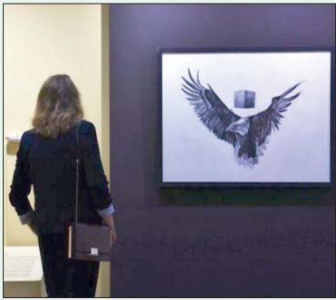
جانب من الأعمال المعروضة

وأيقونوغرافية للمسكوكات في صلة مباشرة بموريتانيا وبالبحر الأبيض المتوسط المجاور. ويقدم المعرض، الذي يتواصل إلى غاية 31