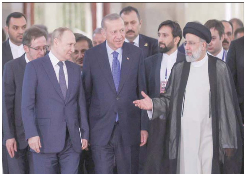
بوتين (يسار) وإردوغان ورئيسي خلال توجههم لمؤتمر صحافي في طهران

رفض إسرائيل للقرارات الدولية المتعلقة بالجنون المحتل، يرى بعض المراقبين أنها وردت لتفادي فصل القمة وتوقيتها عن التطورات الإقليمية والدولية، لا سيما زيارة بايدن للمنطقة وقمة جدة من جهة، والموقف الإسرائيلي من الحرب الروسية الأوكرانية من جهة أخرى، رغم حرص موسكو على نفي ذلك.