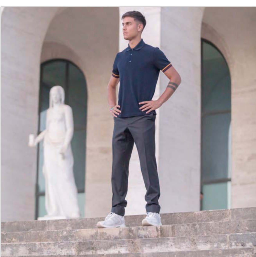
... واللاعب في أزياء لكل يوم من التشكيلة

فالملاحظ أنه عندما ربطت «ديور» اسمها بنادي باريس سان جيرمان وجيورجيو أرماني بفريق نابولي و«مونكلير» بـ«إنتر ميلان»، فإن الفكرة تعدت مجرد توفير أزياء لاعبيها على أرض الملاعب وخارجها، إلى تعزيز صورة الموضة كثقافة تستمتع إلى نبض الشارع وتفهم تغيراته وتحولاته... وفي الجهة الأخرى، وقع العديد من اللاعبين تحت سحر الموضة إلى حد أن بعضهم مثل اللاعب الإسباني هكتور بيليرين أصبح عارض ومصمم أزياء إلى جانب كونه ناشطاً في مجال البيئة.