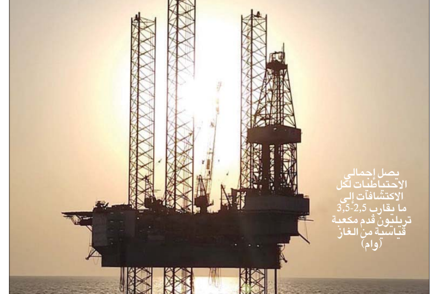
وصل إجمالي الاحتياطيات لكل الاكتشافات إلى ما يقارب 2,5-3,5 تريليون قدم مكعبة قياسية من الغاز (وام)

أبوظبي، «الشرق الأوسط» أعلنت شركة بتروبل أبوظبي الوطنية (أدنوك) أمس عن ثاني اكتشاف من موارد الغاز الطبيعي في أول بحر استكشافية ضمن امتياز المنطقة البحرية رقم 2 في أبوظبي، والتي تديرها شركة «إيني» الإيطالية، حيث يقدر حجم الاكتشاف من كمين جديد بحوالي 1,5-1 تريليون قدم مكعبة قياسية من الغاز الخام. وأوضحت الشركة الإماراتية أن هذا الاكتشاف الكبير يأتي بعد الاكتشاف الأولي في المكان الأقل عمقا، والذي تم الإعلان عنه في فبراير (شباط) الماضي، ما يجعل إجمالي الاحتياطيات لكلا الاكتشافين يصل إلى حوالي 2,5