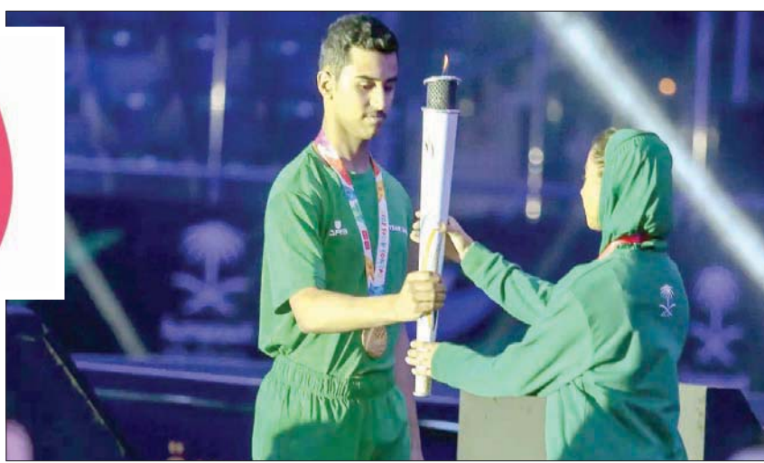
الفيل متفائل يظهر أبطال جدد من خلال دورة الألعاب السعودية

والقارية بإذن الله». كما أعلنت اللجنة عن تغيير آلية المشاركة في الدورة التي ستبثها القناة الرياضية، ليكون التنافس فيها بين الأندية بدلاً من نظام المناطق المعلن مسبقاً؛ حيث ستشهد الدورة مشاركة أكثر من 200 نادٍ تتنافس في 45 رياضة فردية وجماعية، تشمل 5 رياضات تم تخصيصها