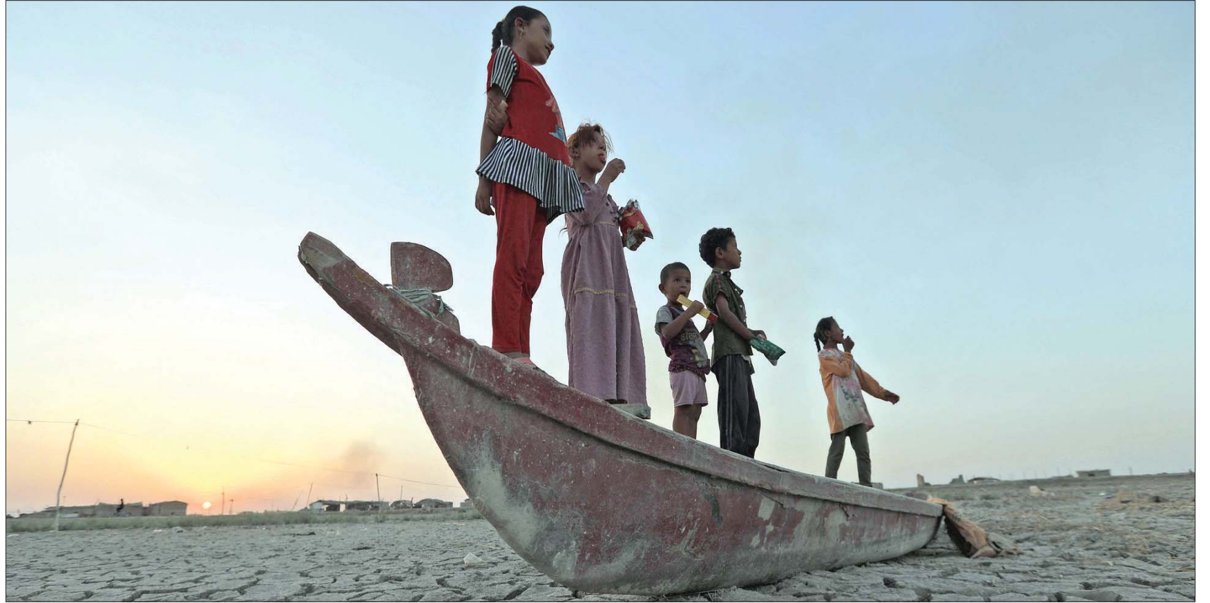
أطفال عراقيون يقفون على مركب راس في مجرى مائي ضربه الجفاف بمحافظتي ذي قار