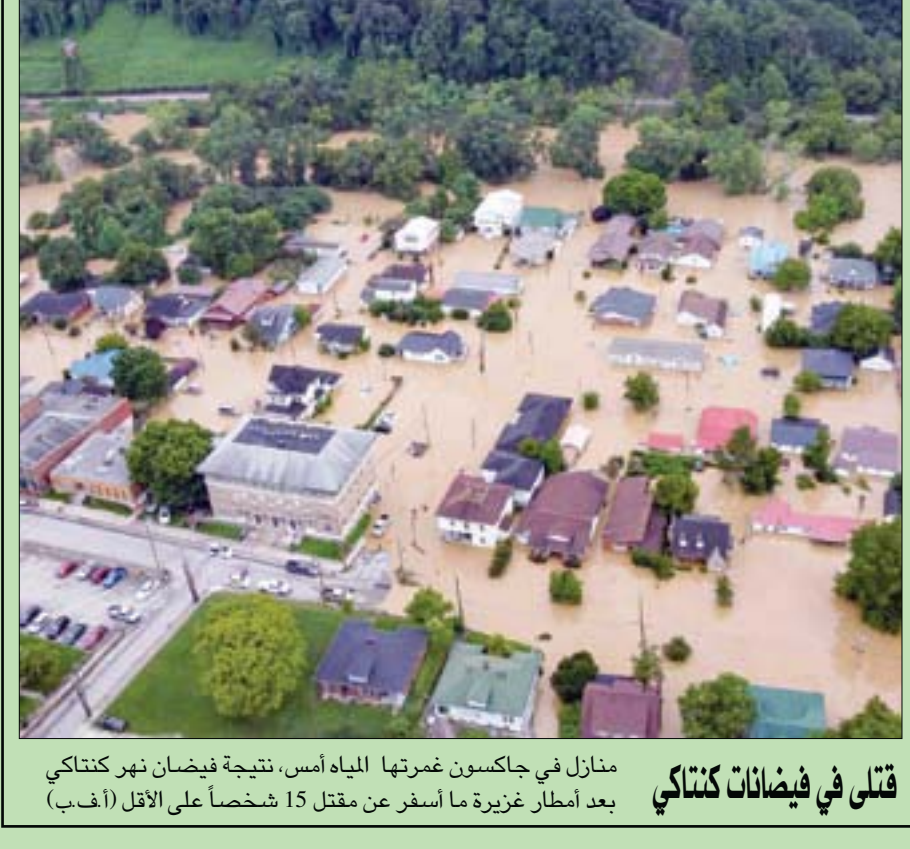
منازل في جاكسون غمرت المياه أمس، نتيجة فيضان نهر كنتاكي بعد أمطار غزيرة ما أسفر عن مقتل 15 شخصاً على الأقل قتل في فيضانات كنتاكي