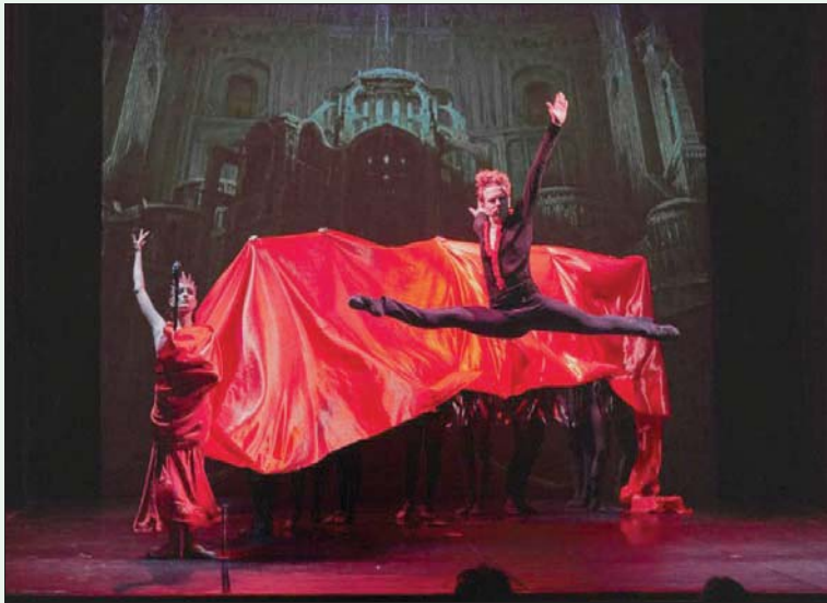
من باليه «مصاص الدماء» (دار الأوبرا المصرية)