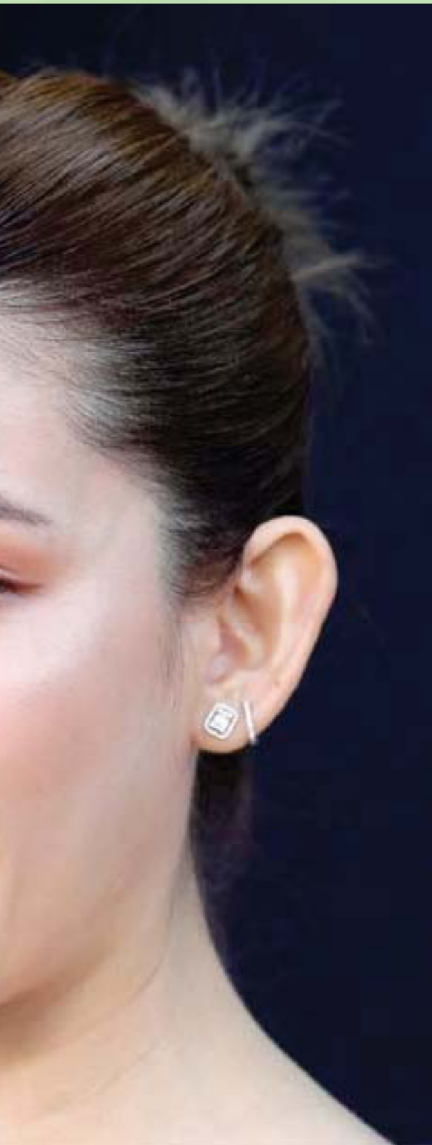
الممثلة التيلاندية باتراكورن تانغسوباكول حضرتت العرض الأول لفيلم «ثرتين لايفز» في دار سينما ويستود في لوس أنجلوس

العلاقان الإنجليزيان يخوضان أقوى اختبار قبل انطلاق الدوري الممتاز