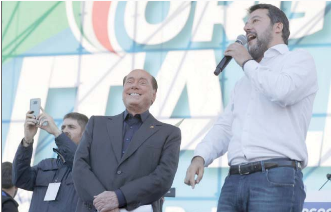
سالفيني وبرلوسكوني يخاطبان جمعاً انتخابياً بروما في 19 أكتوبر 2019

ليجتمع بعدد من الدبلوماسيين الروس عدة مرات منذ بداية الشهر الماضي. يذكر أن سالفيني درج في السنوات الماضية على امتداح الرئيس الروسي الذي وصفه بأنه «قدوة لرعاة الاتحاد الأوروبي»، وبلغ به الأمر أن دخل مرة إلى قاعة البرلمان الأوروبي وهو يرتدي قميصاً يحمل صورة بوتين على صدره.