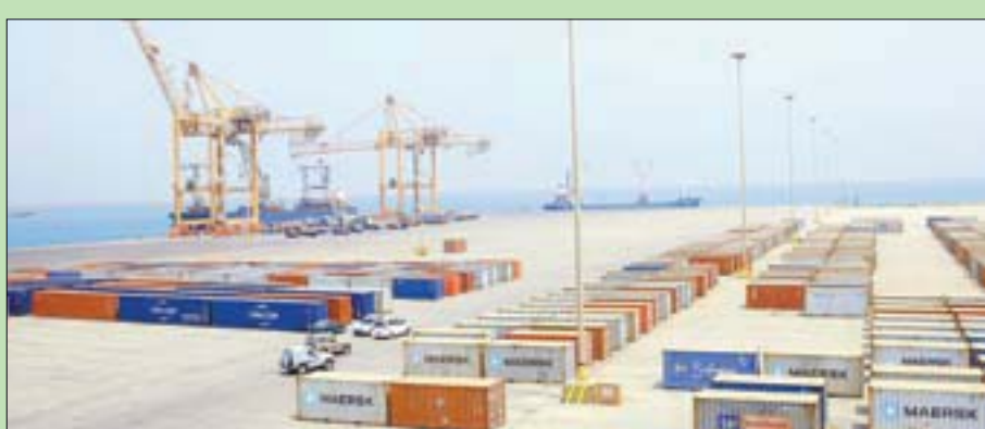
منظر عام لميناء الحديدية (إب.)

خلال العام الماضي بالكامل 2,2 مليار دولار. واعد المسؤول أسباب ذلك إلى زيادة أسعار النفط في العالم من 45 دولاراً للبرميل الواحد إلى أكثر من 100 دولار للبرميل، وقال إن ذلك يشكل عبئاً إضافياً على البنك المركزي الذي يعمل بكل قوة من أجل الحفاظ على استقرار سعر العملة المحلية.