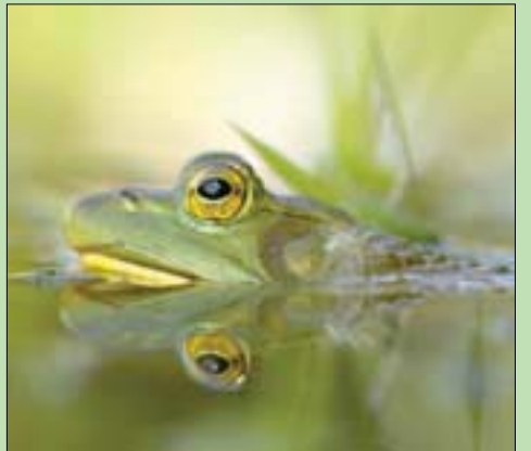
غزوات البرمائيات والزواحف يمكن صدّها بالكشف المبكر (Public Domain)

جاء العسكري جعفر النميري وخلع الرجل الجليل إسماعيل الأزهرى، وتوالى العسكر على الخرطوم. ووضعوا كبار القادة والزعماء الوطنيين في السجون، أو منازل بلا نوافذ. وكما يحدث عادة في هذه المتهاتم الدائرية، صار السجن الأكبر في السجن هو أيضاً.