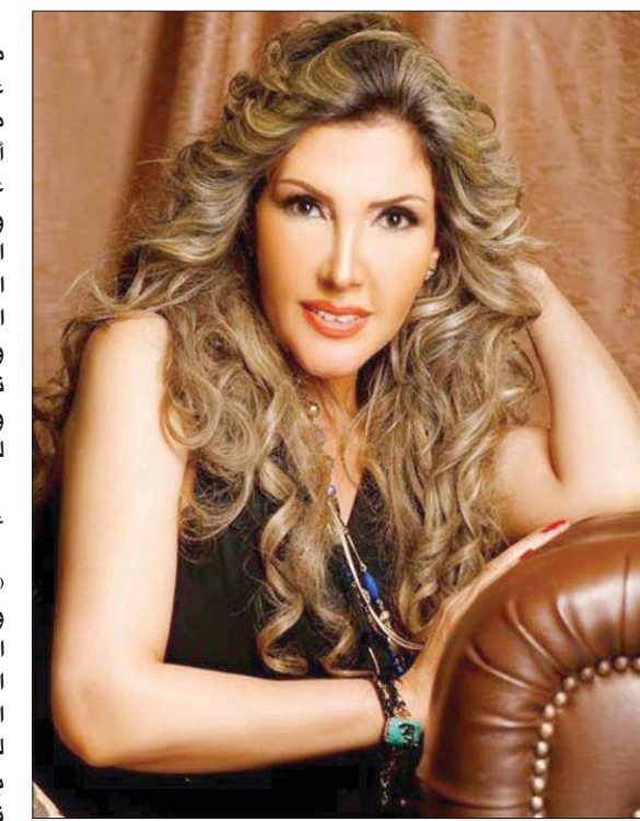
المطربة المصرية نادية مصطفى

اعتز كثيراً بما قدمته معهم وقد اضافوا لي الكثير، فهؤلاء