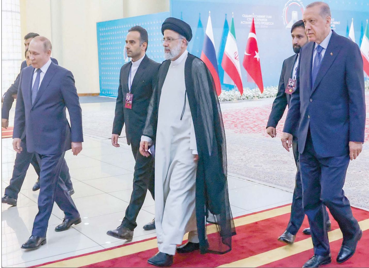
رئيسي مستقبلاً صيفيه إردوغان (يمين) وبوتين في طهران

في الحقيقة، انعقدت قمة طهران الثلاثية في سياق تطورات أكسبتها اهتماماً دولياً واسعاً. فهي جاءت في الوقت الذي تخاطر إيران منذ فترة طويلة في مفاوضات بخصوص ملفها النووي عبر مسار متذبذب صعوداً وهبوطاً، فضلاً عن المواجهة العلنية مع إسرائيل أخيراً. أما بالنسبة لروسيا، فإنها اليوم في مواجهة معنوية مع الولايات المتحدة وحلف شمال الأطلسي «ناتو»، بسبب الحرب في أوكرانيا ودعم الغرب لتسليح أوكرانيا والعقوبات على روسيا... وصولاً إلى الاهتمام بحل أزمة تصدير الحبوب من أوكرانيا التي اكتسبت دفعة بتوقيع الاتفاقية الرباعية بين روسيا وأوكرانيا وتركيا والأمم المتحدة - في إسطنبول على 22 يوليو الحالي - بشأن إنشاء ممر آمن في البحر الأسود لصادرات الحبوب والمنتجات الزراعية والأسمدة من أوكرانيا وروسيا. وهذه الأخيرة اتفاقية تعلق عليها الآمال في إنقاذ الملايين من الجوع وتقص الغذاء حول العالم.