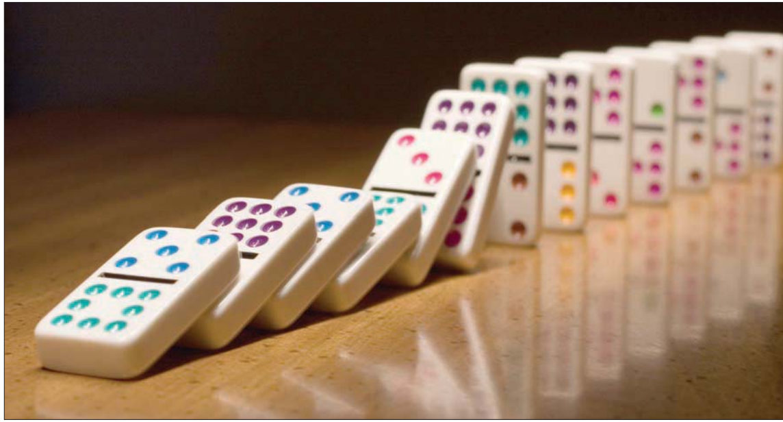
يخشى العالم من الدخول في متوالية الركود التضخمي وسط ازِمات اقتصادية حادة

القاهرة: أحمد الغمراوي مع توالي ظهور بيانات الربع الثاني من العام في مختلف الدول الكبرى، يظهر تباعاً أن الركود يتسلل إلى مفاصل العالم الاقتصادية، ورغم مختلف جهود الإدارات والبنوك المركزية لوقف النزف، فإن الضغوط كانت أقوى من الجميع. كما أن تواصل اتجاه الركود وتوسعه، بينما التضخم في حالة انفلات، سيؤدي إلى الدخول في أسوأ الحالات الاقتصادية قاطبة المعروفة باسم «الركود التضخمي». بداية الضربات جاءت من الولايات المتحدة، حيث أكدت الأرقام حدوث انكماش للربع الثاني على التوالي لكثير اقتصاد العالم، وهو ما يحقق تقنيا مفهوم «الركود»... لكن الإدارة الأميركية يبدو أنها تجتهد في إنكار الحقيقة وتغيير التعريفات الراسخة.