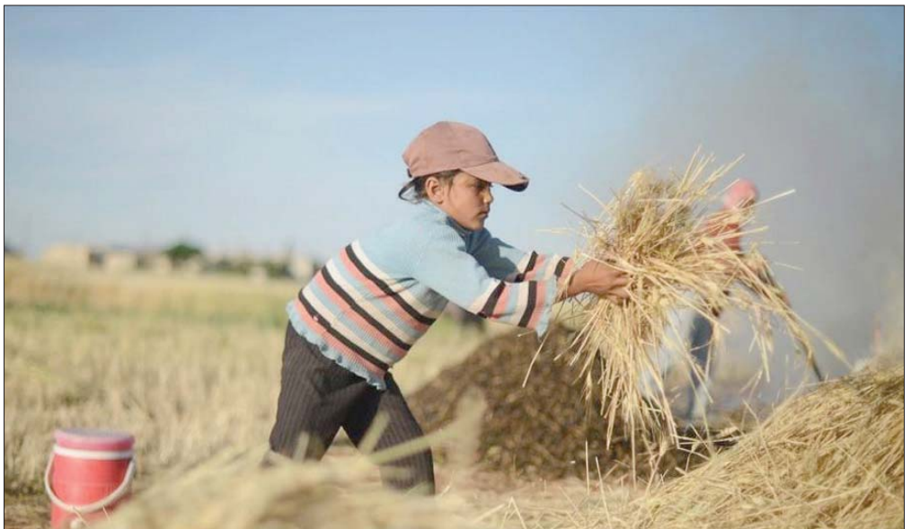
جانب من حصاد محصول القمح في مصر