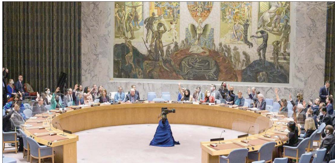
مجلس الأمن خلال جلسة خاصة بالتطورات في ليبيا (البعثة الأممية)

لدعم الحوار الليبي». ومضى يقول إن «التكوين الحالي لجهود الوساطة الأممية في ليبيا لا يتماشى مع المشكلات الملحة للنسوية الليبية». وانتهى القائم بأعمال الممثل الدائم لروسيا، داعياً الأمين العام للأمم المتحدة، إلى تقديم مرشح «جدير وموثوقاً لمنصب ممثله الخاص لليبيا ورئيس بعثة الأمم المتحدة للدعم في ليبيا، والذي يناسب الابعين الليبيين الرئيسيين، وكذلك الإقليميين، من أجل موافقة أعضاء مجلس الأمن على الترشيح». ورت مصادر تحدثت مع «الشرق الأوسط» أن «المناكفات السياسية بين موسكو وواشنطن بشأن القضايا الليبية هي انعكاس لتأثيرات الحرب الروسية على أوكرانيا، وأن البعثة الأممية ضحية هذه الخلافات»، رافضة «تحويل بلاها إلى ساحة للصراعات الدولية، والخلافات على توسيع النفوذ». ودفعت التعقيبات التي واجهها غوتيريش، من بعض الدول المعتزلة على تعيين مبعوث جديد لليبيا في ظل تعدد