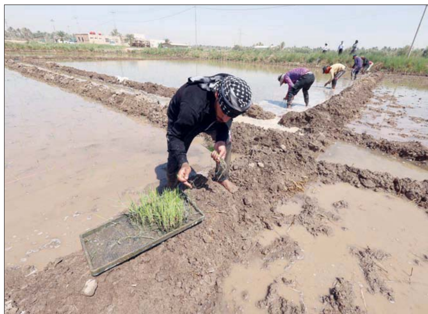
عراقيون يعملون في حقل أرز في النجف

السفيرة الأمريكية الجديدة لدى العراق لينتا رومانوسكي، أعلنت حال مباشرتها عملها في العراق مؤخراً، أنها تحمل تفويضاً لواصله دعم إدارة الموارد المائية في العراق وتعزيز إكفائه الذاتي. وكتبت رومانوسكي في مقال: هنا في العراق «بلاد ما بين النهرين». يُعد ضمان إمدادات المياه للعراق مصلحة استراتيجية تشترك فيها الولايات المتحدة مع العراقيين. لقد تزامن وصولي الشهر الماضي مع بداية صيف آخر طويل حار وجاف. وفي مستهل لقاءاتي مع المسؤولين العراقيين، أدهشني قلقهم بشأن أزمة شح المياه وأثار الجفاف على البلاد. وكما هو الحال مع البلدان الأخرى في جميع أنحاء العالم، يؤدي الأمن المائي دوراً حاسماً في ضمان سلام العراق وازدهاره. بيد أنه