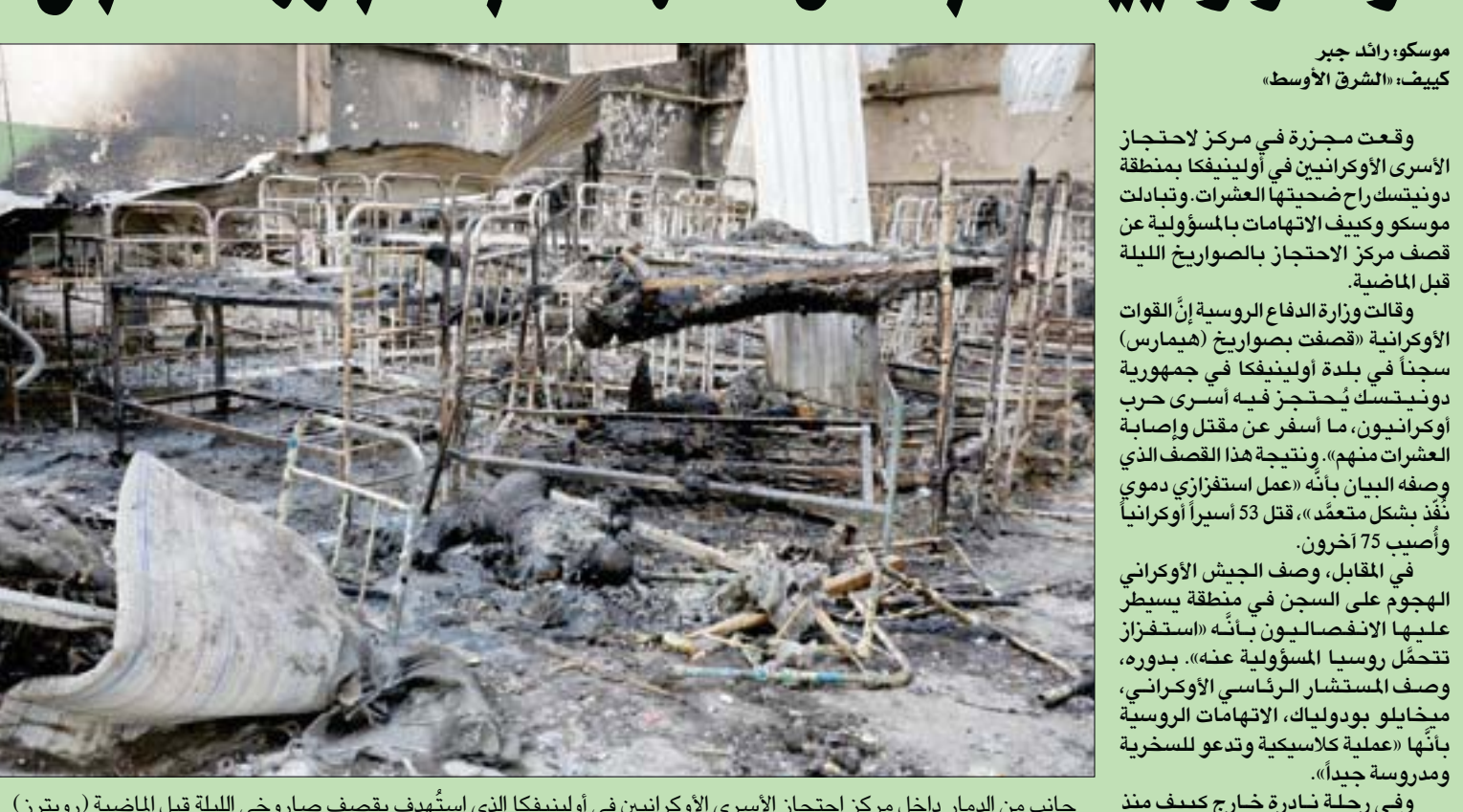
جانب من الدمار داخل مركز احتجاز الأسرى الأوكرانيين في أولينيفكا الذي استُهدف بقصف صاروخي الليلة قبل الماضية