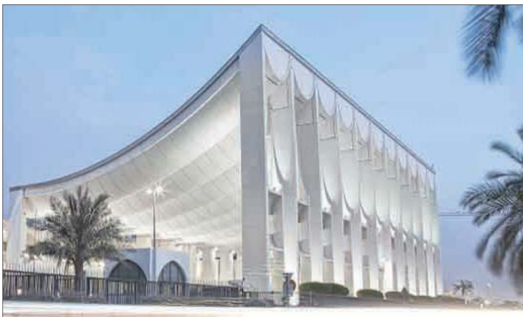
مقر مجلس الأمة الكويتي

أعضاءها اليمين أمام مجلس الأمة، أن ترفع مرسوم حل مجلس الأمة، وهي المهمة المنتظرة من الحكومة الجديدة. ويكمل الدكتور الفيلبي شرحه فيقول: «مرسوم حل المجلس هو من المراسيم التي يجب أن تكون مفرونة بسبب، وذلك مقرون في المادة 107 من الدستور، وقد أقرت المحكمة الدستورية ذلك، إلا أنها بينت في حكم سابق لها أنها لا تراقب ملاءمة السبب، فهي تتفقد بالتأكد من وجوده فقط». أما بشأن أداء الرئيس الجديد للحكومة مهامه، فيوضح الفيلبي: «إلى أن يشكل رئيس مجلس الوزراء الجديد الشيخ أحمد النواف حكومته، فإنه لا