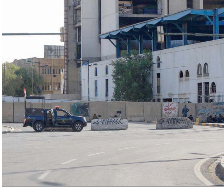
حواجز خرسانية على طريق يؤدي إلى المنطقة الخضراء أمس