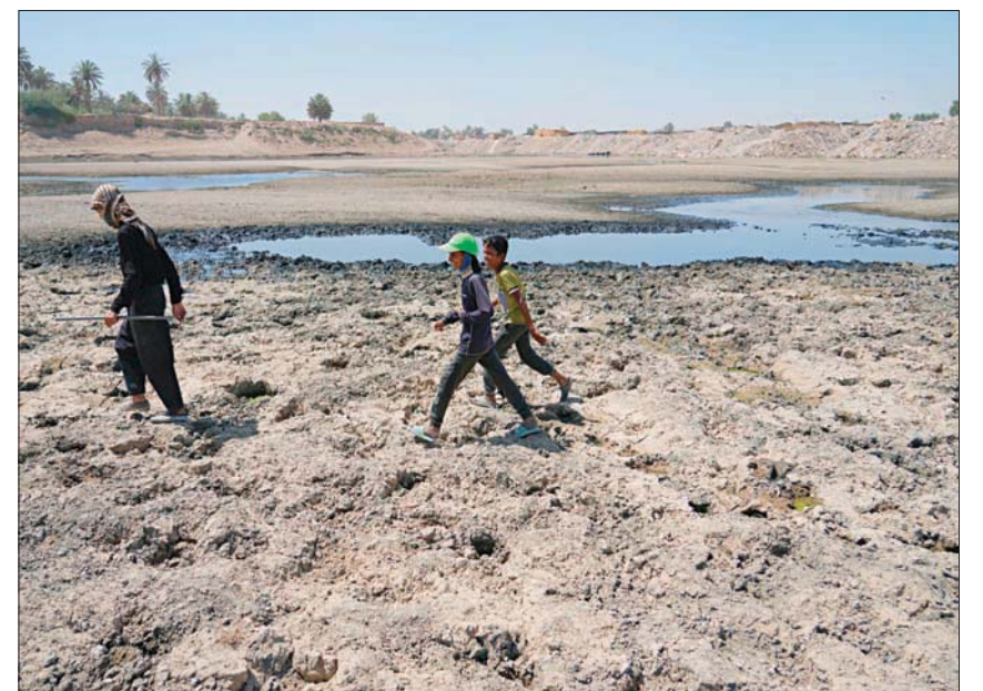
عراقيون يعبرون نهر ديالى الذي تراجع منسوبه بشكل كبير