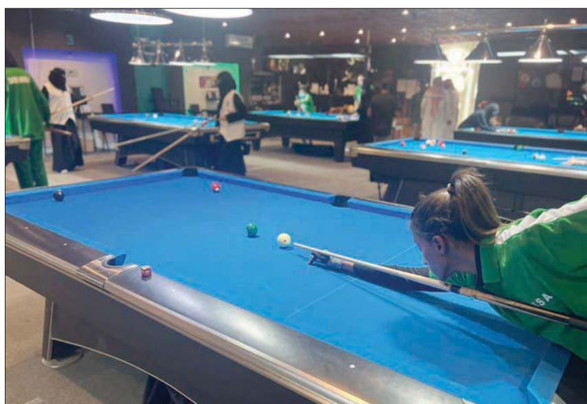
إقبال كبير تشهده لعبة البلياردو من قبل الفتيات السعوديات

الدورات حيث إن هذا سيعني تركيز الاهتمام من قبل إدارات الأندية على اللعبة ومنحها المكان الذي تستحقه في هذه الأندية ما سينعكس بشكل إيجابي على تطورها وتجهيز أفضل اللاعبين واللعبات فيها. كما سيتم تصنيف الأندية التي بعد الـ «17» في دوري ثانٍ حيث إن هناك اعتماداً للصدور والهبوط للفرق في جميع الفئات والدرجات.