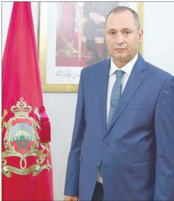
وزير الصناعة والتجارة المغربي رياض مزور (الشرق الأوسط)

وقال مزور إنه «على الرغم من هذه العوامل، فقد تمكنا من توفير المنتجات، وأكمننا السيطرة على التضخم، ودعمنا أسعار مواد غذائية أساسية مثل الخبز والسكر، ما سمح بدعم الأسر المغربية التي تواجه بعض الصعوبات من حيث القوة الشرائية، لكن بشكل أقل بكثير من دول أخرى».