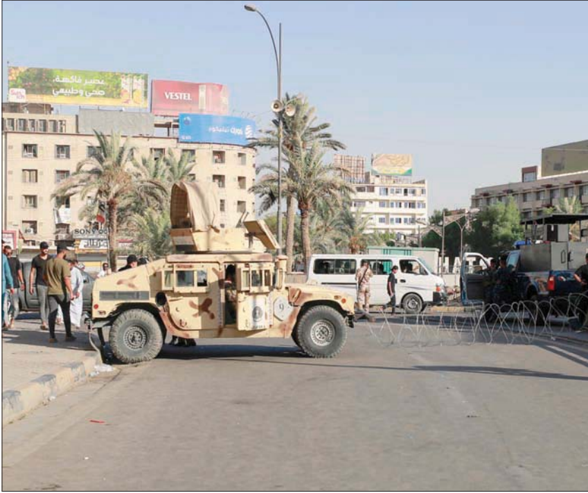
قوة أمنية تقطع طريقاً مؤدياً إلى وسط بغداد أمس

المتيسرة لدعم قطعاً عاتياً في تنفيذ واجباتها... المشتركة تقدم الإسناد الجوي سواء كان في القوة الجوية أو طيران الجيش لقطاعات عمليات بغداد، وتساندنا في الاستطلاع المسلح وغير المسلح»، مشيراً إلى أن «الكثير من الواجبات التي تم تنفيذها في حزام بغداد ضد أوكار تنظيم داعش الإرهابية من مناطق حزام العاصمة... تتم بالتنسيق مع العمليات المشتركة».