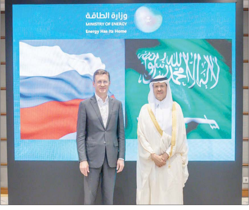
وزير الطاقة السعودي خلال اجتماعه مع نائب رئيس الوزراء الروسي في الرياض أمس