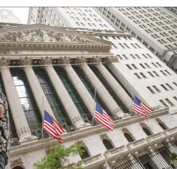
صعدت أسواق الأسهم العالمية مع توالي الإعلان عن نتائج فصلية فائقة للشركات الكبرى في أغلب القطاعات

في المعاملات الفورية 0,6 بالمائة إلى 1766,08 دولار للأوقية (الأونصة). وصعد حوالي 2,3