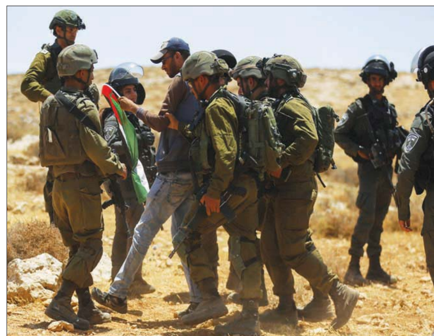
جنود إسرائيليون في دورية روتينية في الضفة الغربية

مجموعة المستوطنين لحمانيهم. وأضافت القننة الاستيطانية أن قائد قوة عسكرية إسرائيلية طلب من أحد الجنود إغلاق طريق وصول المستوطنين إلى المستوطنة، إلا أنه رفض تنفيذ