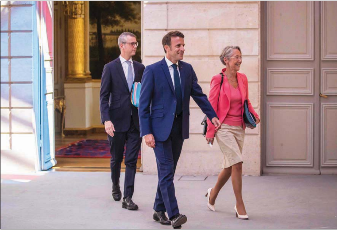
الرئيس الفرنسي ورئيسة وزرائه لدى وصولهما إلى قصر الإليزيه لحضور أول اجتماع للحكومة الجديدة أمس

قد فدعت ماكرون ويورن إلى تعزيز وضع الحزبين الرئيسيين المتحالفين معه في إطار تكتل «معاً»، وهما الحركة الديمقراطية وموديم» التي تنتمي إلى الوسط، وحزب رئيس الوزراء الأسبق إدوار فيليب «أورايرون»، وذلك من خلال تعيين وزيرين رئيسيين بنتميان إلى حركتهما.