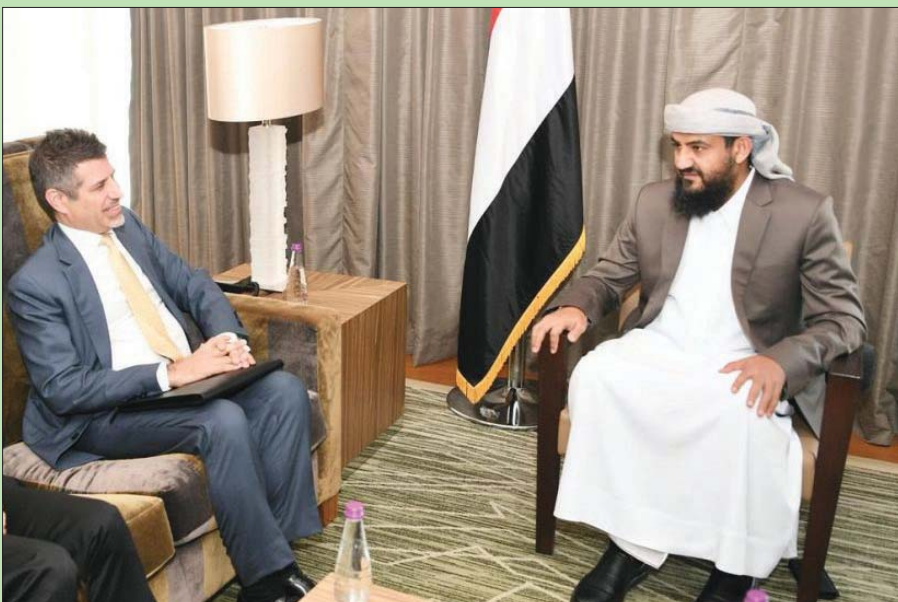
عبد الرحمن أبو زعرة المحرمي عضو مجلس القيادة الرئاسي خلال لقائه السفير الأمريكي لدى اليمن

وميناءً الحديدية لأغراض إنسانية، ولم يقابلها الحوثي إلا بخرق مستدام للهدنة». تصريحات أعضاء الحكم برئاسة رشاد العلمي في السابع من أبريل (نيسان) الماضي جاءت في وقت تواصل فيه الميليشيات الحوثية خرقها للهدنة في مختلف الجبهات.