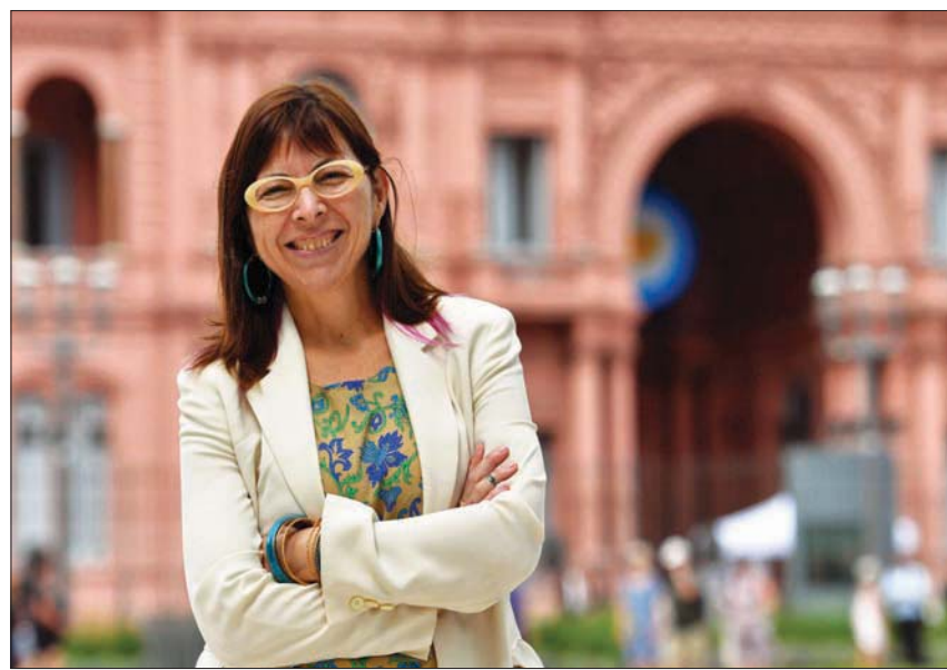
رئيس الأرجنتين عيّن سيفينا باتاكيس وزيرة جديدة للاقتصاد

الائتلاف الحكومي». كما اعتبر أن «مواصلة تعزيز قيادة الاقتصاد الكلي بما في ذلك سياسات المال والنقد وسعر الصرف» هو أمر «أساسي» في اقتصاد يعاني تضخماً تجاوز 60 في المائة خلال عام واحد وانخفاضاً في قيمة البيزو. ووصلت معدلات التضخم للحكومة إلى أدنى مستوى لها منذ توليها السلطة في عام 2019، وسط تضخم مفرط، وتعرض العملة البيزو لضغط متزايد. وتراجعت السندات السيادية.