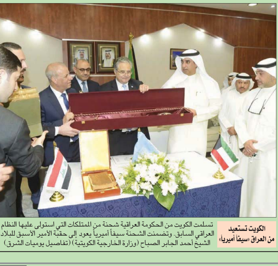
الكويت تستعيد من العراق سيفاً أميرياً