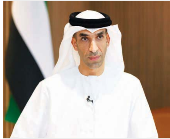
ثاني الزبيدي وزير دولة للتجارة الخارجية في الإمارات

بجري حالياً وضع اللمسات النهائية على الاتفاقية الرابعة من اتفاقيات الشراكة الاقتصادية الشاملة التي ستوكل مع كولومبيا، واصفاً تطور المفاوضات بشأن التوقيع على اتفاقية الشراكة الاقتصادية الشاملة مع تركيا بالمتنازعة، ومتوقعا الانتهاء منها قبل نهاية العام الحالي. وتابع: «بدانا مفاوضات مع بعض الدول الأفريقية وبعض الدول في شرق آسيا، وكذلك مع جورجيا التي تم الإعلان عنها خلال فعاليات إكسبو 2020 دبي. كما تم توقيع الإعلان مع تشيلي والتسويق ما زال قائماً، كما يجري التوصل مع بعض الدول المهتمة، ومنها المكسيك التي أبدت رغبتها، وبعض الدول الأخرى».