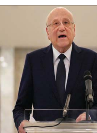
رئيس الحكومة المكلف نجيب ميقاتي (أ.ب)

وبين رئيس الحكومة من ثنائية، وأكد أن «العقبة ناحية، أو بما يتناسب مع مصلحة المواطنين من ناحية في الوقت الراهن هي وزارة