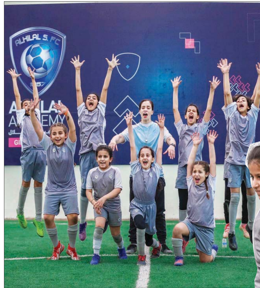
لاعبات أكاديمية الهلال في لحظة جماعية بعد التدريب

وكان نادي النصر أعلن في يونيو (حزيران) الماضي من خلال رئيسه مسلي آل معمر، عزم النادي إنشاء فريق خاص للسيدات في الفترة المقبلة، جاء ذلك رداً على تغريدة في «تويتر» حملت معها مطالبة باستحداث فريق نسائي للنصر.