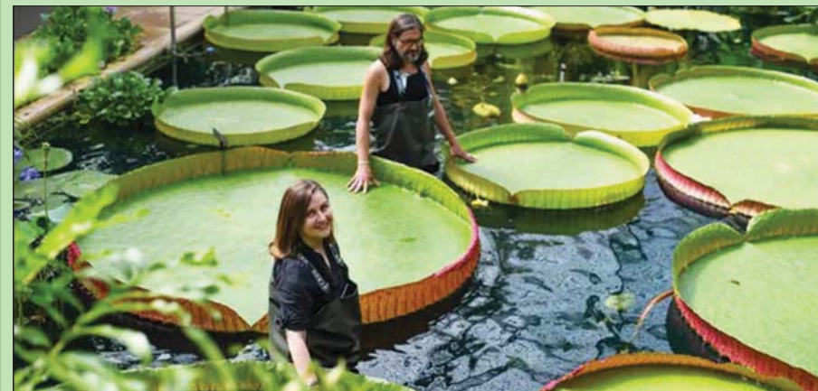
زئبق «فيكتوريا بوليفيانا» (مجلة فرونتيرز إن بلانت ساينسز)

تكريماً للشركاء البوليفيين في الفريق البحثي والنظام البيئي الطبيعي للنبات. و«كيو غاردنز» هو المكان الوحيد في العالم، حيث يمكن رؤية الأنواع الثلاثة من زئبق فيكتوريا: «أمازونكا»، و«كروزيانا»، والآن «بوليفيانا» جنباً إلى جنب.