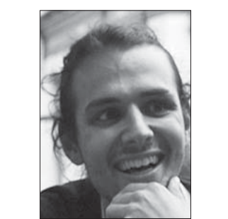
صمويل إيرل *

كل مكان، من ارتفاع مستويات الفقر، إلى تراجع الإنفاق المزمّن على الخدمات الحكومية، فقد انخفضت أجور العاملين في مجال الرعاية الصحية داخل هيئة الخدمات الصحية الوطنية البريطانية، التي يجب المحافظون إعلان ولائهم وإخلاصهم لها، بشكل فعلي، وهناك نحو 110 آلاف وظيفة شاغرة بها. مع تزايد طول قائمة الانتظار لتلقي الرعاية الصحية، كنسبة مئوية من الناتج المحلي الإجمالي، من مستوياته في أميركا. يعد ذلك تطوراً مؤلماً بوجه خاص بالنسبة إلى بلد يفخر بما يتم تقديمه من رعاية صحية به. بالنسبة إلى المحافظين، تقدم فوضى رئاسة وزراء جونسون حجة مرضية، فبعد استغلال جموح وتمرد جونسون في البداية، يزعم المحافظون حالياً أنه يعرقل