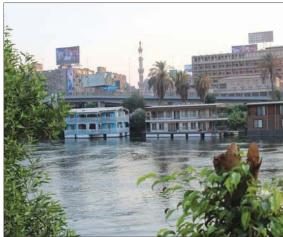
عوامات النيل