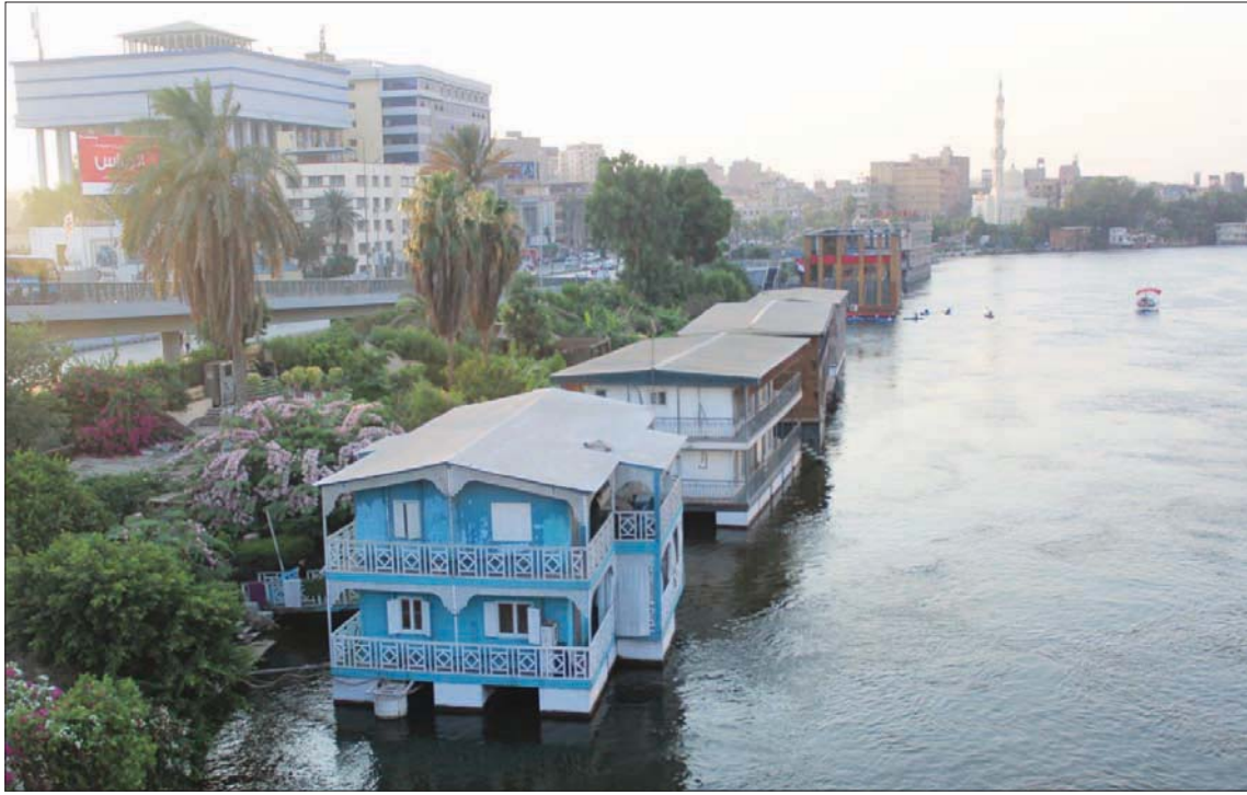
عوامة الحاجة إخلص

يوجد عوامات سكنية في نيل القاهرة الكبرى».