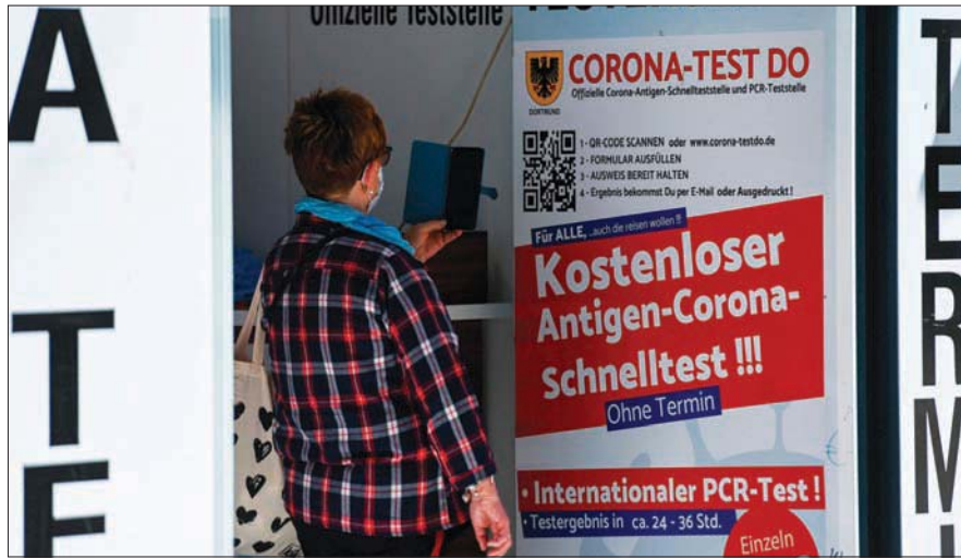
ألمانية تعابن إجراءات فحص «كورونا» في مدينة دورتموند أمس

مقارنة باول من أمس الأحد، وبارتفاع بواقع 1255 حالة عن يوم الاثنين الماضي. وذكرت صحيفة «جايان توداي» أن عدد المصابين الذين يتلقون العلاج بالمستشفيات بسبب أعراض حادة في طوكيو، بلغ ستة أشخاص. وفيما سجلت تايلاند 18 حالة وفاة جديدة و1995 حالة إصابة، أعلنت كوريا الشمالية أن عدد الإصابات عندها انخفض إلى أقل من 4 آلاف لليوم الثاني على التوالي، وفقاً لوسائل إعلام حكومية. وأعلنت