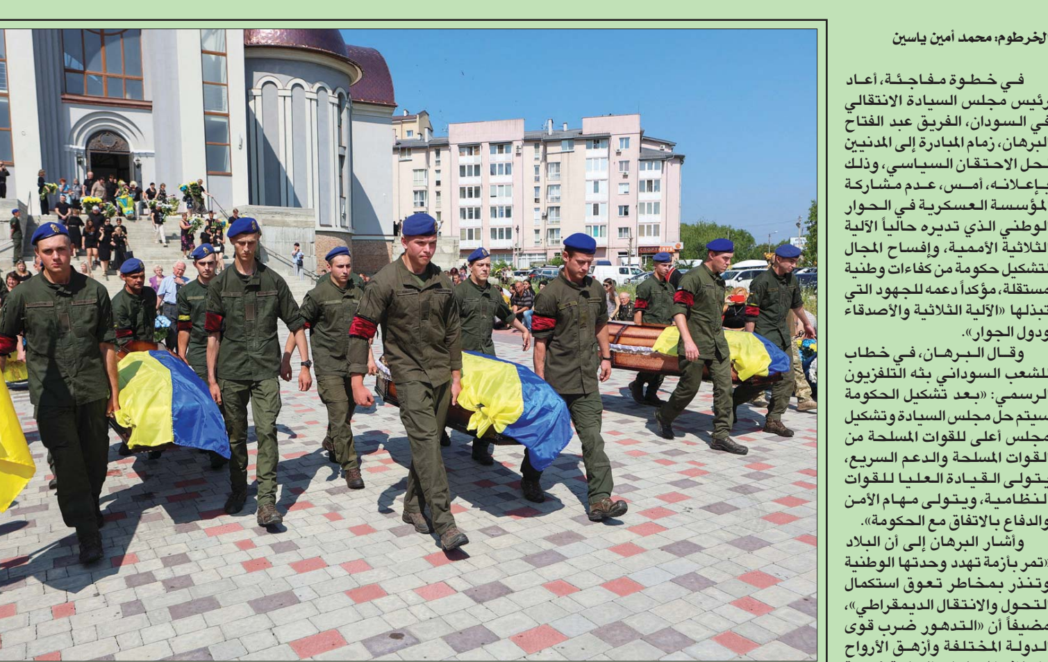
جنود أوكرانيون يحملون نعوش رفاق لهم قتلوا في الحرب مع القوات الروسية خلال مراسم تشييعهم في إيفانو - فرانكيفسك أمس