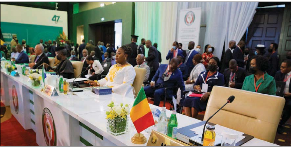
جانج من قمة «إيكواس» في أكرا يوم الأحد

في أكرا لمراجعة خطة تعاملهم مع المجلس العسكري التي وصلت إلى السلطة بالقوة في مالي وغينيا وبوركينا فاسو واتخاذ قرار بشأن العقوبات على هذه الدول. ولم يتخذ قادة الثلاثة المعنية. وتكثف المجموعة في جلسة مغلقة أن المجموعة «تتبنى ملتزمة بدعم هذه الدول الشقيقة للعودة إلى