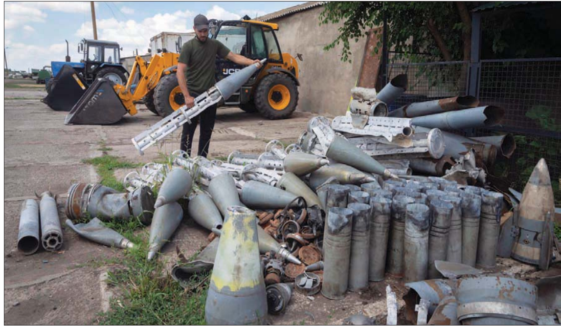
أوكراني يجمع بقايا صواريخ روسية وجدها في مزرعته قرب جبهة قتال في منطقة دنبرودنيبروفسك أمس

كييف - موسكو، الشرق الأوسط، اتخذت القوات الأوكرانية خطوطاً دفاعية جديدة في الشرق، أمس (الاثنين)، استعداداً لمرحلة جديدة صعبة في الحرب، حيث أعلن الرئيس فلاديمير بوتين «الانتصار» في معركة لوغانسك التي استمرت لأشهر، وأمر بمواصلة الهجوم. ووضع استيلاء روسيا على مدينة ليسيتشانسك، الأحد، حداً لواحدة من أكبر المعارك في أوروبا منذ أجيال، التي شهدت قيام موسكو بجلب قوتها البرية كاملة لتحمل على جيب صغرى على خط المواجهة لمدة شهرين. وتكتمل المعركة بغزو روسيا لمقاطعة لوغانسك، وهي إحدى منطقتين تطالب موسكو بتنازل أوكرانيا عنهما للانفصاليين في منطقة دونباس.