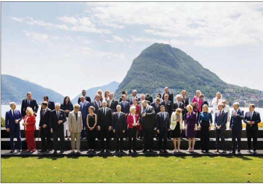
القادة المشاركون في اليوم الأول من مؤتمر إعادة إعمار أوكرانيا في لوغانو بسويسرا أمس

رئيسياً) للتمويل يمكن أن يكون عبر مصادرة أصول روسيا والأوليغارش الروس المجمدة بموجب العقوبات الدولية ضد موسكو، في محاولة لوقف القتال. وتتراوح تقديرات حجم الأصول المجمدة بين 300 و500 مليار دولار، بحسب شميغال الذي أوجز أيضاً خطة حكومته لإعادة الإعمار المكونة من ثلاث مراحل. وقال إن الأكثر إلحاحاً هو مساعدة السكان المتضررين من الحرب قبل تمويل آلاف مشاريع إعادة الإعمار في مرحلة ثانية. وعلى المدى الطويل، يجب إعداد أوكرانيا لتكون أوروبية وخضراء ورقمية. من جهته، اعتبر الرئيس السويسري إينياسيو كاسيس أن إعادة الإعمار والإصلاحات «تسير جنباً إلى جنب... إنها تعزز بعضها البعض»، داعياً