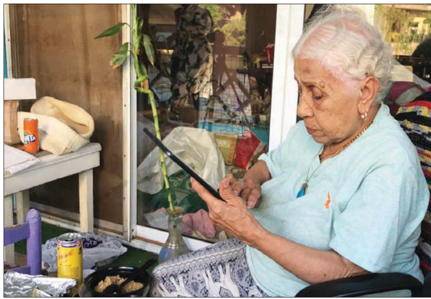
إخلص حلمي قبيل مغادرة عوامتها