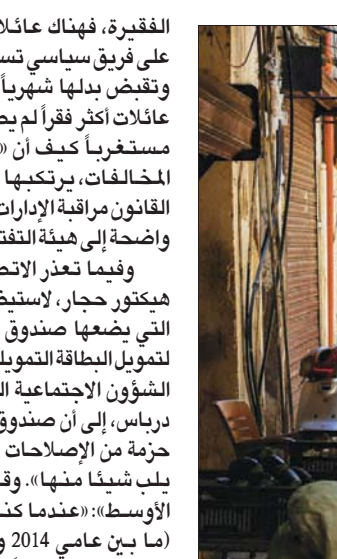
تقديرات أممية تفيد بأن أكثر من 80% من الشعب اللبناني بات فقيراً

واعتبر أن «هذه الدعوة تؤكد مرة أخرى منطق المحاصصة والتعطيل الذي يتبعه فريق رئيس الجمهورية»، مشيراً إلى أن «الدايين لتشكيل حكومة كهذه يريدون زيادة التفرقة والاختلاف بين أعضاء الحكومة، فلا تجتمع على رأي ولا تتخذ قراراً، إذا أدارت البلاد في غياب رئيس جديد للجمهورية».