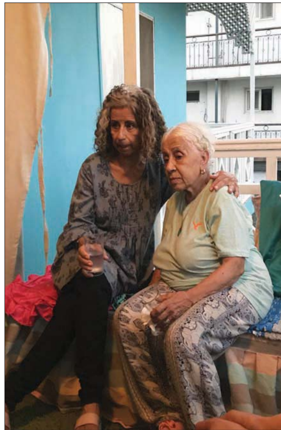
إخلص حلمي وأهداف سوييف قبيل إزالة عوامتها

وترى أن الحيوانات والطيور التي تربيتها بمثابة أسرتها