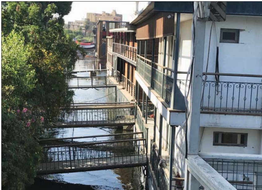
نيل القاهرة يودع العوامات السكنية

وظهرت العوامات في مشاهد درامية متنوعة، من بينها فيلم «ثلاثة فوق النيل»، إنتاج عام 1971، والمأخوذ عن الرواية التي تحمل الاسم نفسه للكاتب نجيب محفوظ ومن إخراج حسين كمال، ومسلسل «أعلى سعر» بطولة نيللي كريم، وفيلم «السفارة» في العمارة» بطولة عادل إمام، والعديد من الأعمال الأخرى.