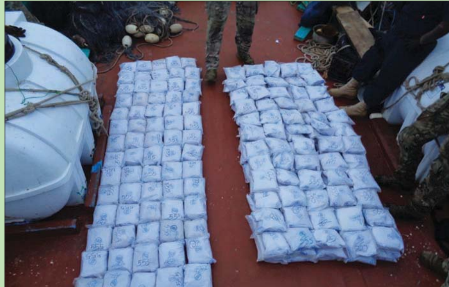
شحنة مخدرات تم ضبطها على متن قارب شرافي في بحر العرب في 27 ديسمبر 2021