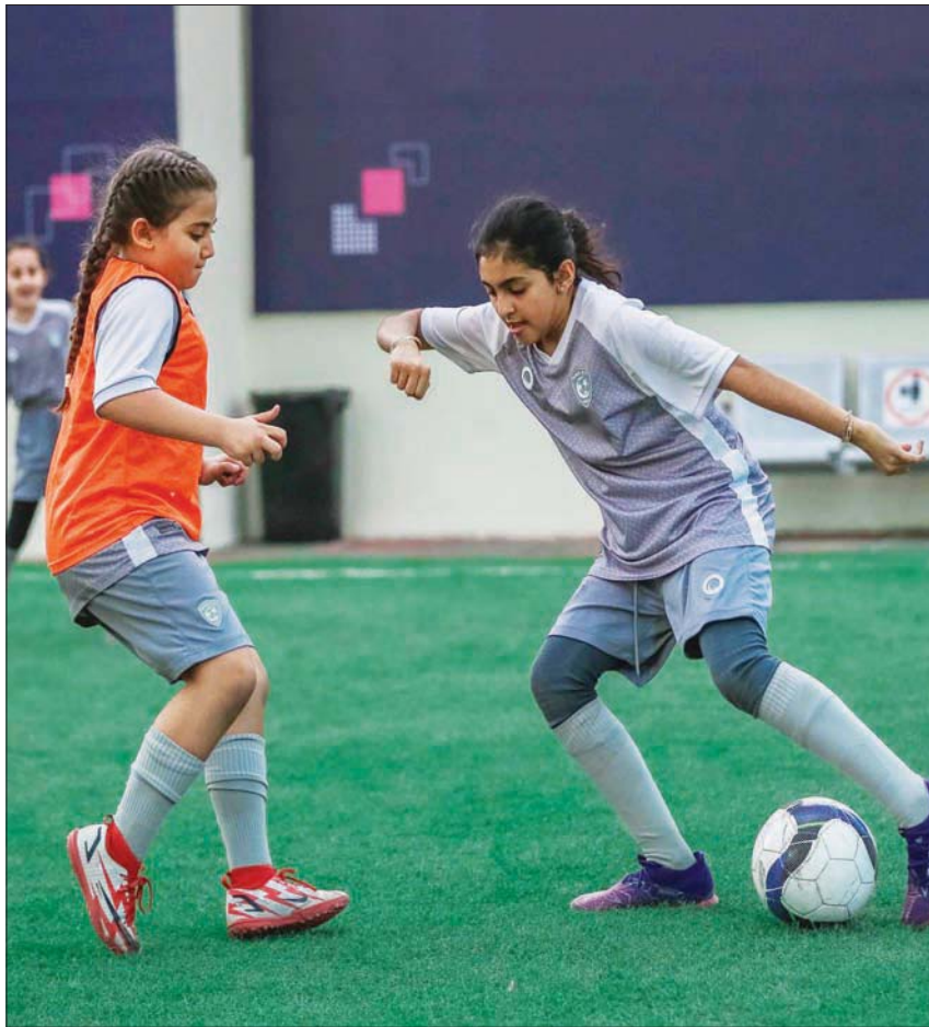
فتيات في صراع على الكرة خلال المران

ويذكر، أن الرياضة النسائية في السعودية تشهد اهتماماً على الصعيد كافة بالإضافة إلى كرة القدم، حيث حصل منتخب السيدات لكرة قدم الصالات على المركز الثاني في بطولة غرب آسيا لكرة الصالات، وكذلك شهد أولمبياد طوكيو 2020 الأخير مشاركة نسائية سعودية في عدد من الألعاب.