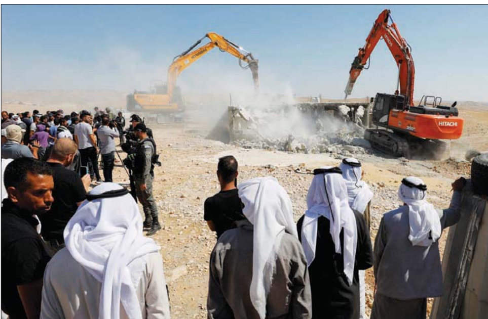
فلسطينيون يراقبون تدمير جرافتين إسرائيليتين لمنزل عربي في قرية يطا بالضفة الغربية

وقالت الخارجية، في بيانها «إن إصرار الحكومة الإسرائيلية على تصعيد انتهاكاتهما وجرائم مستوطنيتها يعتبر تخريباً متعمداً للنتائج المرجوة من هذه الزيارة وإمعاناً في الإجراءات الأحادية الجانب، وشروطاً احتلالية مسيئة مفروضة على الواقع بهدف تغييره وخلق وقائع جديدة تخدم خريطة مصالح إسرائيل الاستعمارية، في رسالة شديدة الوضوح إلى المجتمع الدولي والإدارة الأميركية تؤكد على غياب شريك السلام الإسرائيلي».