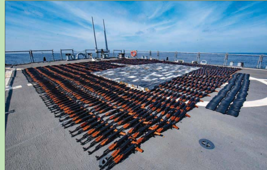
شحنة أسلحة مهزبة تم ضبطها على متن قارب صيد في بحر العرب في 21 ديسمبر 2021

وصارت السفن الحربية التابعة للأسطول الخامس الأمريكي في 2021 ثلاثة أضعاف شحنات الأسلحة غير القانونية بالمقارنة مع عام 2020 بما يعادل 9000 قطعة سلاح. كما صادرت