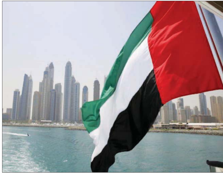
استحدثت برنامج الدعم في الإمارات 4 مخصصات للسكن والتعليم الجامعي والعاطلين عن العمل فوق سن 45 والمتعلم الباحث عن العمل

ويضمن البرنامج الجديد مخصصاً للسكن يتراوح بين 1500 درهم (408,3 دولار) شهرياً، و2500 درهم (680,5 دولار) شهرياً في حال السكن المستقل حتى حصول العائلة على إسكان حكومي، ويستحق المتقدمون الذي يسكنون مع الوالدين أو مع أي أسرة أخرى في المائة من هذه المبالغ.