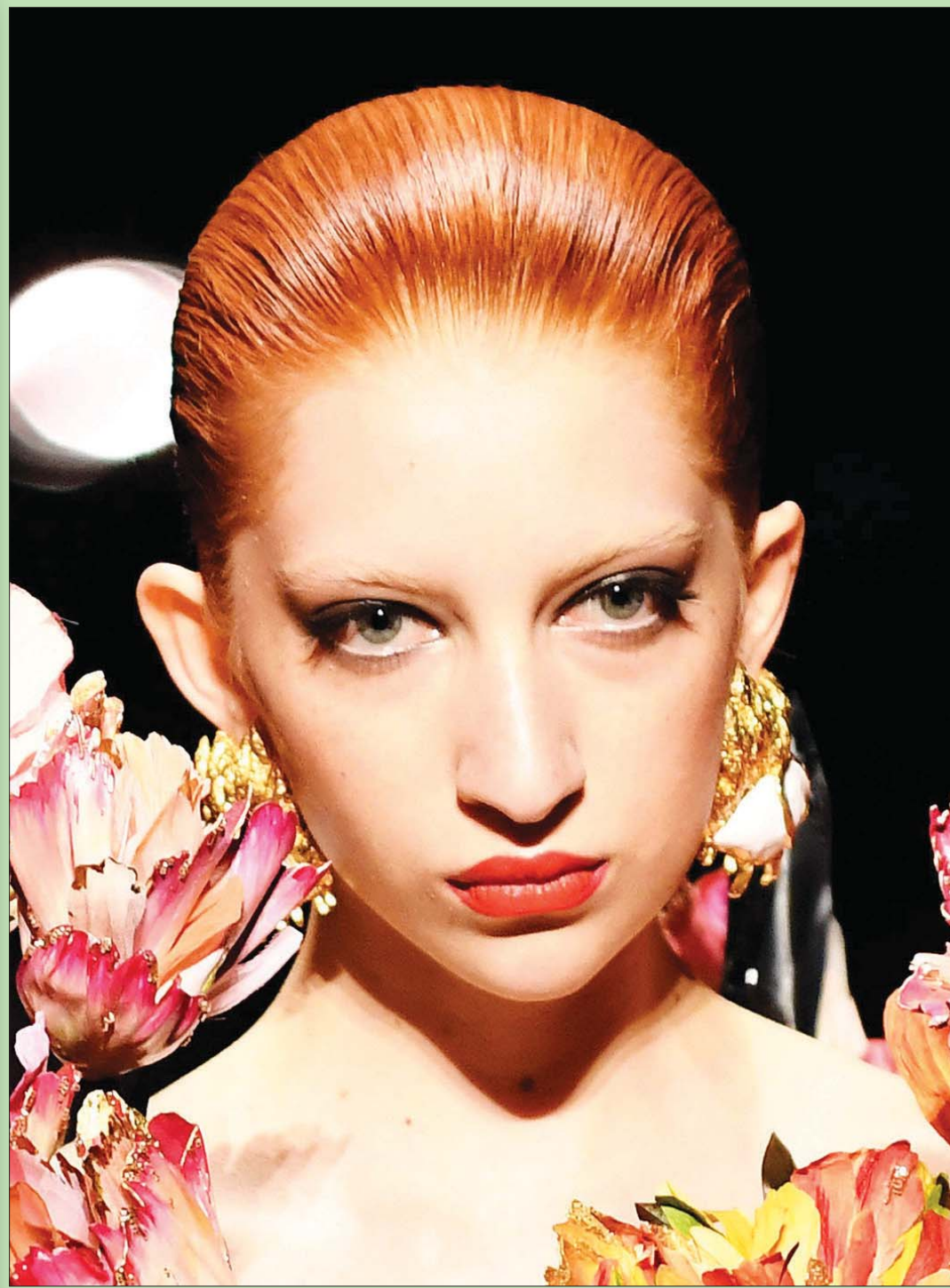
عارضة تقدم تصميماً لشياباريلي خلال أسبوع الموضة للأزياء الراقية لربيع وصيف 2023 في باريس (أ.ف.ب)