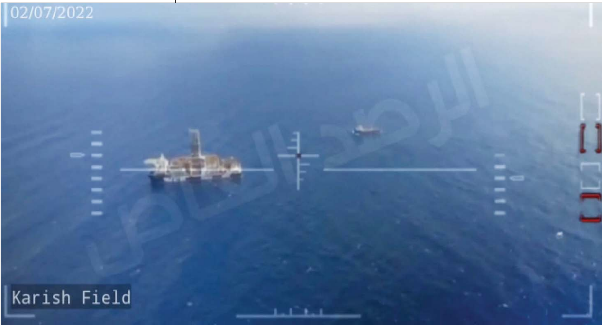
لقطة فيديو وزعه «حزب الله» لشريط التقطته مسيرته فوق حقل كاريش المتنازع عليه بين إسرائيل ولبنان

وقال المصدر، وفقاً لموقع «واللا» الإلكتروني، أمس (الاثنين)، إن طائرات «حزب الله» التي اقتربت من الحيز الاقتصادي البحرية التابعة لإسرائيل، أسقطت فعلاً وهذا مهم. لكن عملية مواجهتها تراكمت مع إخفاق بحثناج إلى فحص وتحقيق. فقد كان من المفترض أن تتمكن طائرات سلاح الجو المقاتلة من تدمير الطائرات الثلاث وهي في الجو، لكنها تمكنت من إسقاط واحدة وأخفقت في إسقاط الثانية والثالثة. وبحسب التحقيق العسكري الإسرائيلي الأولي، يتضح أن طائرتين من طراز «إف 16» انطلقتا إلى الجو حال اكتشاف طائرات «حزب الله» المسيرة، وتمكنت إحداهما من اعتراض وإسقاط واحدة منها فقط بواسطة صاروخ جو-جو، وحاول الطيارون الإسرائيليون إسقاط طائرة ثانية فوجدوا صعوبة في متابعتها، لأنها طارت على علو منخفض، وعندما جرى إطلاق صاروخ نحوها لم يصعبها بأذى. وأما الطائرة المسيرة الثالثة، فلم يتمكن الطيارون من العثور عليها فأكملت طريقها باتجاه منصة حقل الغاز «كاريش».