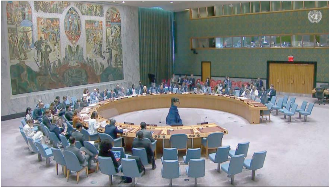
لقطة من بث مباشر لاجتماع مجلس الأمن الليلة الماضية

الحلول الدبلوماسية توفر السبيل الوحيد إلى تحقيق السلام والأمن الدائمين». وتحدث المندوب الدائم للاتحاد الأوروبي لدى الأمم المتحدة، أولوف سكوغ، نيابة عن مسؤول السياسة الخارجية في الكتلة الأوروبية، جوزيب بوريل، بصفتها منسق اللجنة المشتركة لخطة العمل المشتركة الشاملة، فعرضت أولاً السياق المتعلق مع إيران، ثم قال: «بعد أكثر من عام من المفاوضات المتعددة الأطراف المكثفة، نعتقد أن لدينا صفقة جيدة على الطاولة»، موضحاً أن هذه ليست صفقة ثنائية بين إيران والولايات المتحدة». وأكد أن «التطورات النووية الإيرانية لا تزال مصدر قلق كبير، خاصة ما يتعلق بتكديسها المستمر لليورانيوم المخصب بنسبة 20 في المائة، و60 في المائة، وتركيب أجهزة طرد مركزي أكثر تطوراً». وادّعى عن إدراكه التزم لأن إيران واجهت ولا تزال تواجه عواقب اقتصادية سلبية خطيرة بعد انسحاب الولايات المتحدة من خطة العمل، قال إن استعادة الخطة «هي الطريقة الوحيدة لإيران لجني الفوائد كاملة (...) والوصول إلى إمكاناتها الاقتصادية الكاملة». ورأى أنه «من المهم إظهار الإرادة السياسية والبراعة لتأمين الاتفاقين لاستعادة خطة العمل الشاملة المشتركة على أساس النص المطروح على الطاولة».