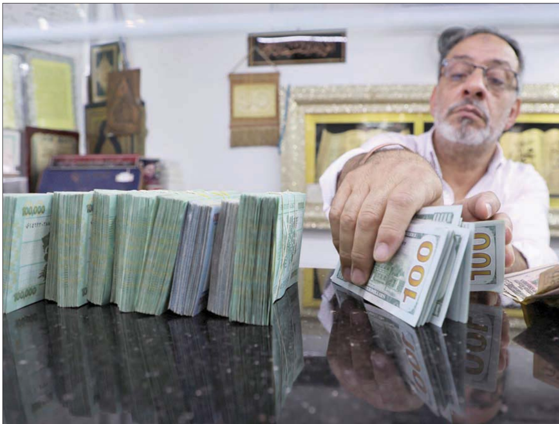
داخل أحد محلات الصرافة في بيروت أمس

بيروت، علي زين الدين وسع رئيس حكومة تصريف الأعمال نجيب ميقاتي أمس، قاعدة التأييد الداخلية لخطة التعافي التي اطلقتها حكومته في وقت سابق، وتذليل حالة الاعتراض عليها من قبل المودعين وجمعية المصارف ومصرف لبنان، وذلك في «تعديلات جوهرية» اضافها عليها، وعرضها على «لجنة المال والموازنة» النيابية شفهيًا، وسط مطالب بتقديمها مكتوبة وتوثيق الضمانات المنوطة بموجب الخطة للمودعين في المصارف اللبنانية، واستعمال ميقاتي لتقديمهها إلى صندوق النقد الدولي قبل سبتمبر (أيلول) المقبل. واضفت مشاركة ميقاتي والفريق الوزاري الاقتصادي وممثلين للبنك المركزي، البعد الاستثنائي المرتقب على اجتماع لجنة المال والموازنة، وسط حضور نيابي كثيف من الأعضاء وغير الأعضاء في اللجنة، توخيا للاطلاع عن كثب على وجهة التعديلات المستحدثة التي سيجري اعتمادها ضمن استهداف تامين التأييد الأوسع مذكرة السياسات المالية والاقتصادية الملخصة بخطة التعافي. وعلم أن مداولات النواب واستئلتهم ركزت، بحسب مصادر مشاركة، على ضرورة استنباط أفضل المقاربات التي تخصي إلى حماية المودعين من كل الفئات وعدم تعريضهم لاقطاعات مجحفة