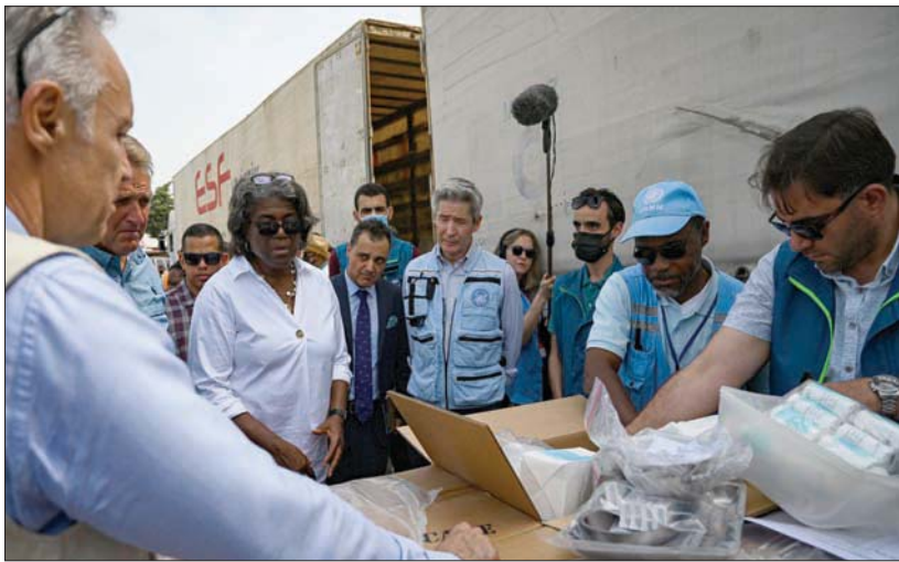
غرينفيلد خلال زيارتها الحدود السورية - التركية مطلع يونيو المنصرم

غوتيريش أفاد بوضوح في تقرير حديث بأن «الغارات عبر الحدود، حتى لو نفذت بشكل دوري، فلا يمكن أن تحل محل حجم ونطاق عملية الأمم المتحدة عبر الحدود، التي لا تزال النموذج المثق للحياة لملايين الناس المحتاجين في شمال غربي سوريا».