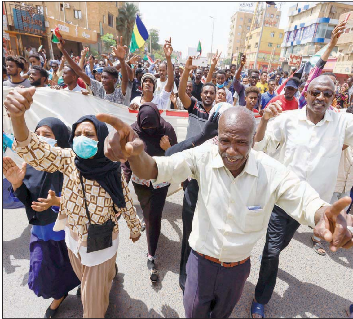
مظاهرون في العاصمة السودانية الخرطوم أمس

وتقدر الأمم المتحدة أن 18 مليون سوداني من إجمالي 45 مليوناً، سيعانون بنهاية السنة من اندعام الأمن الغذائي؛ أكثرهم معاناة 3,3 مليون نازح يقيم معظمهم في دارفور.