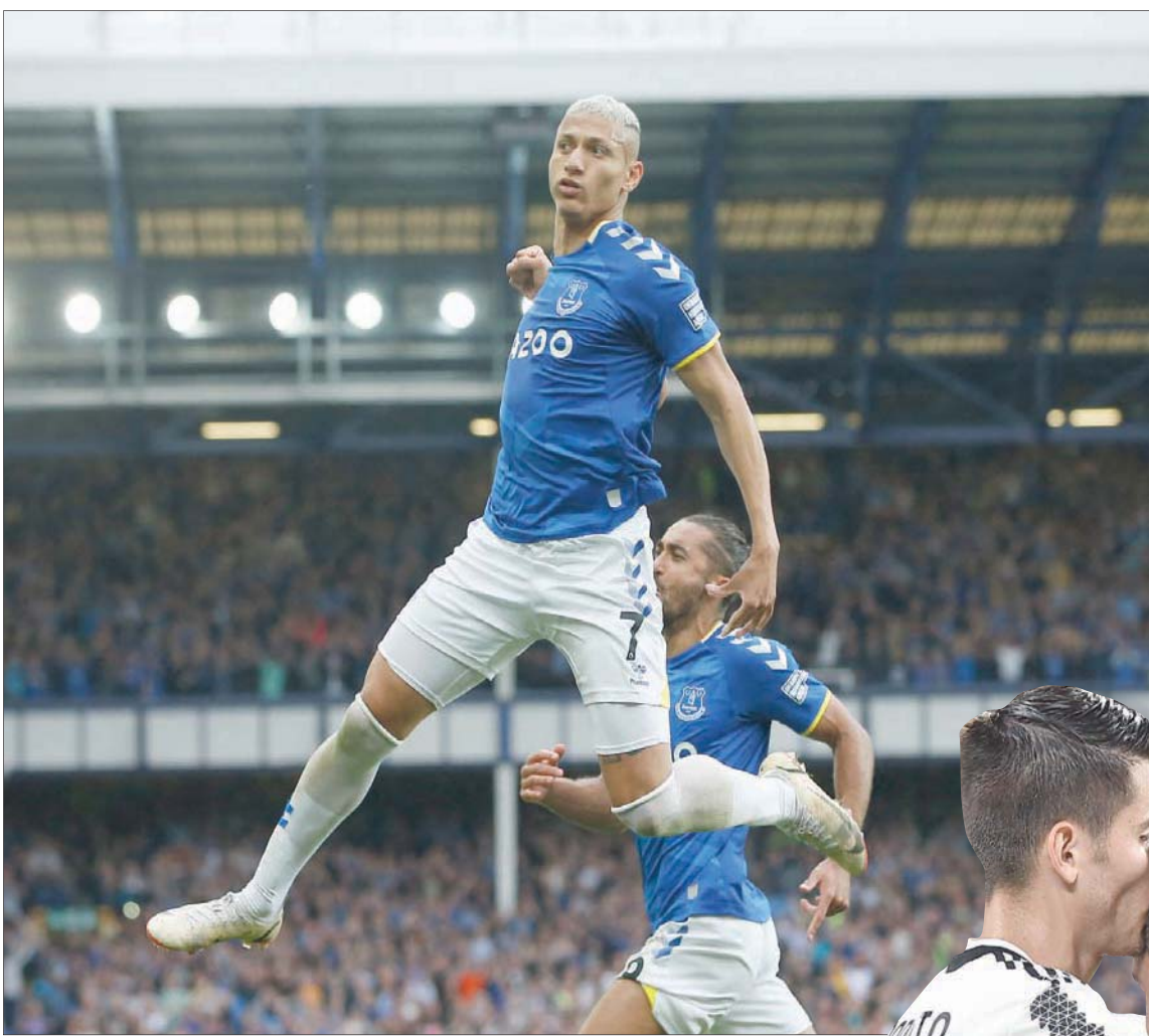
ريشارليسون من إيفرتون إلى توتنهام لتعزيز القوة الهجومية

وتزوج موراتا في صفوف السيدة العجوز بلقب الدوري الإيطالي مرتين عامي 2015 و2016 وكاس إيطاليا ثلاث مرات أعوام 2015 و2016 و2021. وكان مهاجم ريال مدريد الإسباني وتشيلسي الإنجليزي سابقاً عاد إلى يوفنتوس في سبتمبر (أيلول) عام 2020 على سبيل الإعارة لمدة موسمين.