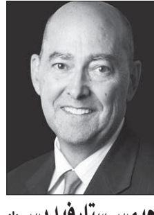
جيمس ستار فيلديس *

الرئيس فلاديمير بوتين تشكل بالتاكيد تهديداً للحلف. وتعتبر الحروب ضد أوكرانيا في عامي 2014 و2022 لبدأ على طوح بوتين للسيطرة على التوجهات الغربية تجاه امته. هذا الأسبوع، ولأول مرة منذ عام 2010، ستعقد في فيينا قمة استراتيجيا جديداً ويعتقد. وسجحت هذا مرة أخرى في شبه الجزيرة الأيبيرية، التي تمتد في المحيط الهادئ الذي يربط بين 30 عضواً في التحالف عبر الأطلسي. والأز، ماذا سيناقش المفهوم الاستراتيجي الجديد؟ وما الذي يعنيه اعتماد هذا المفهوم للمنظمة الموقرة؟ من الواضح أن روسيا ستكون على رأس أولويات الجميع. الملاحظ أنه بعد تعرض الدولتين الديمقراطيةين وشركي الناتو، جورجيا، وأوكرانيا، لاجتياح، والغزو الناعم، لولدوفا، تبني الحلف نهجاً صارماً تجاه الاتحاد الروسي. الآن، أبحث عن الكلمات القوية التي من شأنها تقنين الزيادة الفاعلية الكبيرة، التي تتجلى في مضافة ألمانيا غير العادية لجزائيتها العسكرية لهذا العام. وسيلتزم كثير من الدول هدف