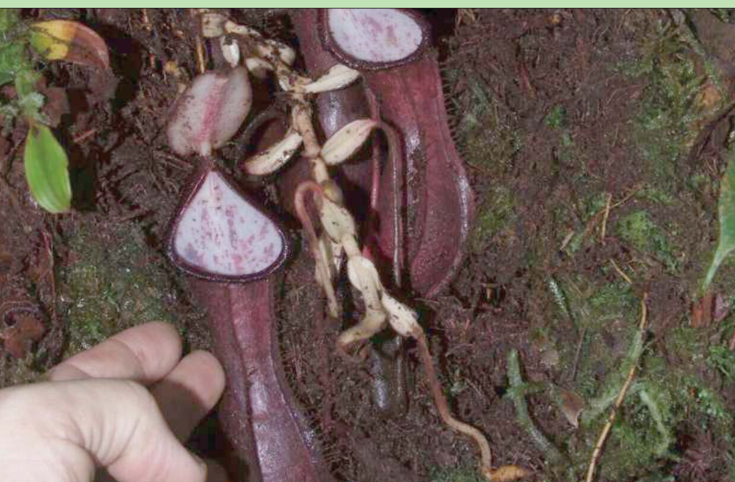
أباريق استخرجت من تحت الأرض (الفريق البحثي)

يلزم من مكوناتها. وبينما توجد أباريق أغلب أنواع هذه النباتات على السطح، كانت