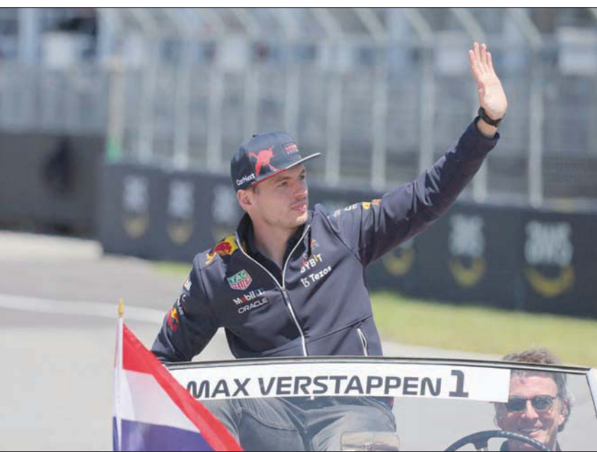
فيرستابن الذي يقدم عروضاً لافتة هذا الموسم ينتظر تحدياً صعباً في سيلفرستون

يصل عددها إلى 140 ألفاً. ويتطلع هاميلتون، صاحب الرقم القياسي في عدد الانتصارات على أرضه (8)، إلى أداء جيد بعد إجراء بعض التعديلات على سيارته، ومنتظراً أن يحظى بدعم جماهيري كبير في سيلفرستون، خاصة بعد التعليقات العنصرية التي أدلى بها بطل العالم البريطاني.