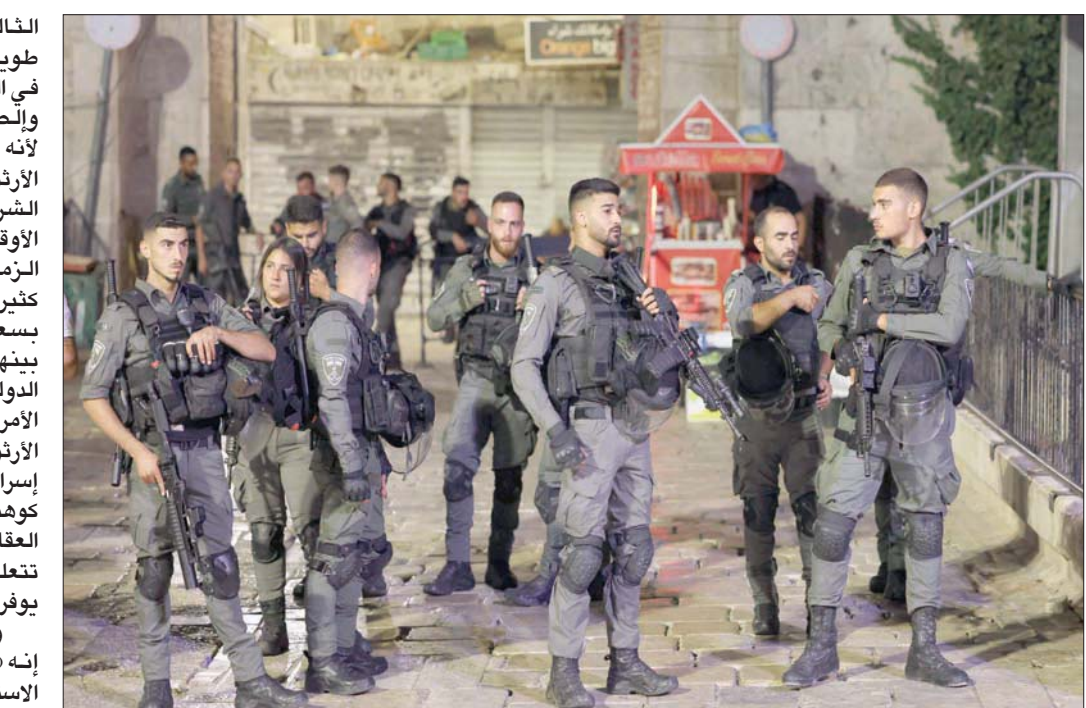
جنود إسرائيليون عند باب دمشق في القدس المحتلة

الأرثوذكسية. إن أن المستوطنين يريدون طردهم من هناك بدعى أنهم «الملاك الجدد الذين أصبحوا أصحاب القرار الوحيدين في هذه العقارات»، لكن في جلسة أول من أمس الأربعاء، وافقت المحكمة على أن للمستأجرين الفلسطينيين في هذه المباني حقوقاً قانونية للاستحواذ على العقارات الأرثوذكسية، في أحد أهم مواقع الوجود العربي الإسلامي والمسيحي في القدس». وبعد خسارة القضية في المحكمة، بدأت معركة أخرى لمساندة المستأجرين الفلسطينيين في صمودهم في العقارات