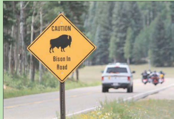
علامة تحذر من «البَيْسون» داخل حديقة «غراند كانيون الوطنية» في شمال أريزونا (أ.ب)

لوس أنجلوس: «الشرق الأوسط» علامة تحذر من «البَيْسون» داخل حديقة «غراند كانيون الوطنية» في شمال أريزونا (أ.ب).