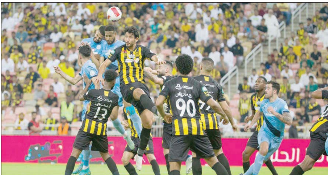
الاتحاد يسعى لتدعيم صفوفه بعناصر جديدة في الموسم المقبل