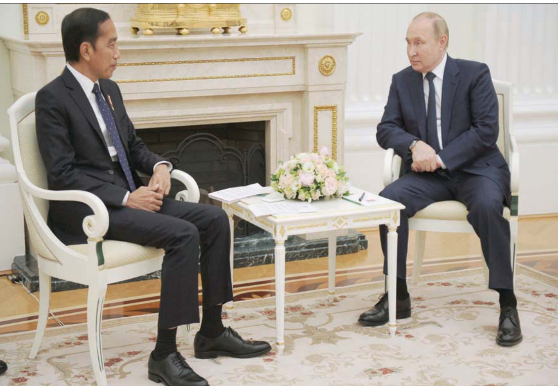
بوتين اجتمع مع نظيره الإندونيسي في موسكو أمس

يمتلكان معا ما يقدر بحوالي 11 ألف رأس نوبي.