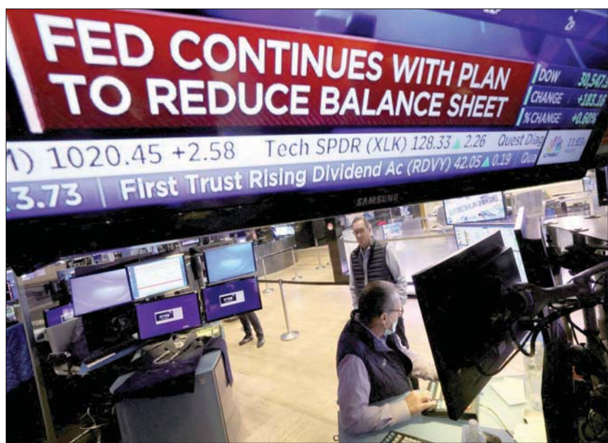
تسببت الضغوط والمخاوف في مرور وول ستريت بأسوأ نصف سنوي منذ عام 1970

وقال مات سيمسون، كبير محللي السوق في سيتي إنديكس، إن صعود العوائد والدولار الأميركي لعب دوراً في ضعف أداء الذهب، لكنه أشار إلى أن الذهب السعر بعملة أخرى لم يكن أداؤه سيئاً للغاية. وبحوم الدولار بالقرب من أعلى مستوياته في عقدين، ويمكن أن يسجل أفضل ربع له منذ أكثر من خمس سنوات، مما يجعل الذهب السعر بالدولار أكثر تكلفة للمشتريين الذين يحملون عملات أخرى. ومن بين المعادن النفيسة الأخرى، ارتفعت الفضة في المعاملات الفورية 0,4 في المائة إلى 20,80 دولار للأونصة، بينما استقر البلاتين عند 917,18 دولار، وزاد البلاديوم 0,9 في المائة إلى 1979,88 دولار.