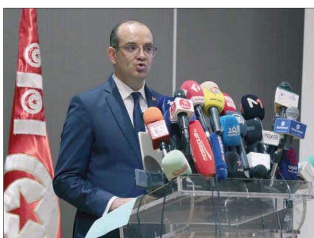
بوعسكر في مؤتمر صحفي بالعاصمة أمس

ومن المنتظر أن يقترح الدستور الجديد العودة إلى النظام الرئاسي، وأن يكون الرئيس هو الذي يتولى تعيين الحكومة، وأن تكون الحكومة مسؤولة أمام الرئيس لا أمام البرلمان، الذي سيكون دوره ثانوياً في مراقبة أداء الحكومة، وهو ما خلف جدلاً سياسياً حاداً حول مستقبل المؤسسات الدستورية في تونس.