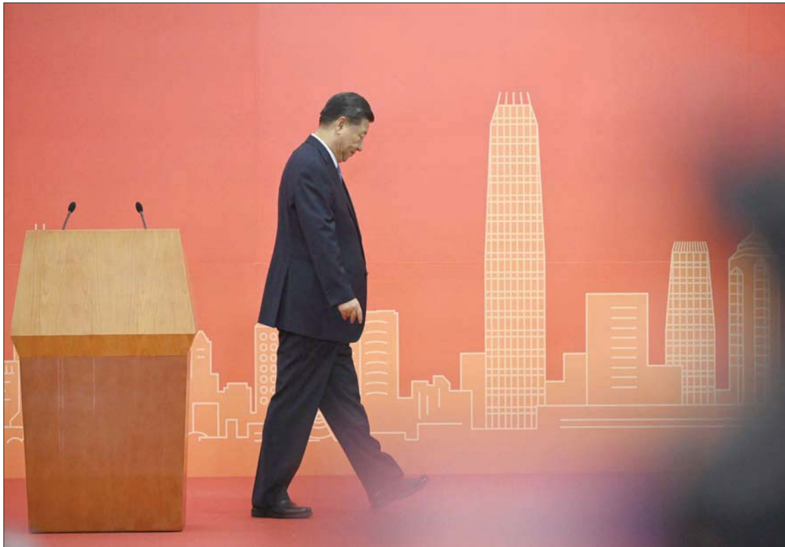
شكلت زيارة شي مناسبة للحزب الشيوعي الصيني لإظهار سيطرته على هونغ كونغ بعد مظاهرات مطالبة بالديمقراطية قوبلت بتشدد من بكين في 2019

المدينة بعد موجة من القمع السياسي أدت إلى تفكيك الحركة الديمقراطية وسحق المعارضة. تصادف الذكرى الـ 25 اليوم (الجمعة) فيما بات نظام «بلد واحد ونظامان» الذي انفقت عليه بريطانيا والصين عند إعادة المدينة إلى بكين في منتصف المهلة المحددة له؛ إذ ينص على احتفاظ المدينة بنوع من حكم ذاتي حتى 2047. ويرى المنتقدون، أن قانون الأمن القومي الذي فرضته بكين عام 2020 بعد مظاهرات العام 2019 قضى بشكل تام على الحريات الموعودة. اتخذت السلطات خطوات للقضاء على أي مصدر محتمل للإحراج أثناء إقامة شي جينبينغ في المدينة. واعتقلت الشرطة والأمن الوطني تسعة أشخاص على الأقل الأسبوع الماضي. وقالت رابطة الإشتراكيين - الديمقراطيين، أحد آخر الأحزاب السياسية المعارضة المتبقية في هونغ كونغ، إنها لن تتظاهر في الأول من يوليو بعد محادثات مع ضباط من الأمن القومي وقطاعين مرتبطين بالمجموعة. وقال قائد الرابطة لو كالة الصحافة الفرنسية، إنه تم تفتيش منازلهم وإنهم أجروا أيضاً محادثات مع الشرطة. وأفادت شان بو - بينغ، رئيسة المجموعة، بأن لديها الانطباع بأنها مراقبة في الأيام الماضية.