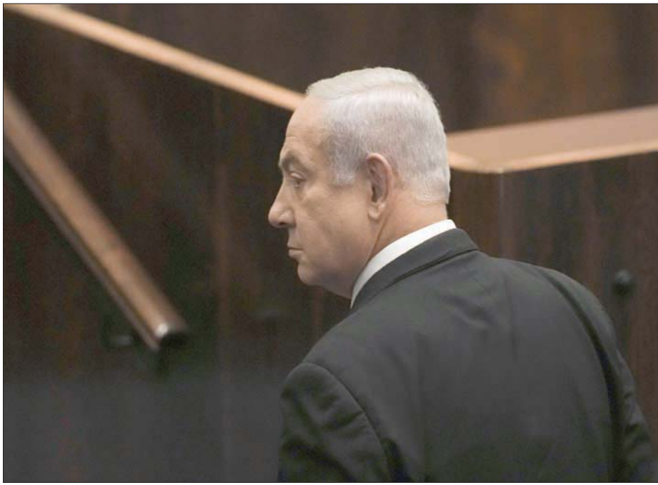
نتياهو الحالم بالعودة إلى رئاسة الوزراء (آب)

على حزبه وبالتالي فشل في الحفاظ على حكومته، وأقر بهذا الفشل عندما انسحب وأعلن الاعتزال، قال إنه سيدعم شريكه، رئيس الحكومة الجديد يائير لبيد. لكنهما يعرفان كم هو نتياهو قوي وخاطر، ولذلك يدرسان إدارة المعركة سوية مع دفعة من كبار المستشارين الاستراتيجيين من البلاد والخارج. والأمر الأول الذي يضعه لبيد نصب عينيه هو أن يقنع الجمهور بأنه يصلح رئيساً للحكومة. وبأنه يغذي هذا المنصب بيقين وعادات جديدة، مثل: التواضع ونظافة اليد والامتناع عن زيادة المصاريف الشخصية والتخالف المتين مع واشنطن والبرهنة على أنه أكثر حزماً من نتياهو في القضايا الاستراتيجية والعسكرية مع إيران وأزعرها وربما مع الفلسطينيين، الذين يقول إنه سيزيد من «كمية الجزر أكثر من كمية العصى» معهم وسيعطي التعاون الإقليمي مع العرب. وهو ينك على وضع خطط اقتصادية تعزز الأذهان وتواصل النمو والانخفاض في البطالة. والأهم من ذلك، يدرس لبيد إحداث تغييرات في تركيبة الأحزاب الحالية. فحينما يوجد حزب يعاني من خطر السقوط والاختفاء وعدم عبور نسبة الحسم من معسكره، يلوح بإمكانية إقامة تحالف بينه وبين حزب آخر، مثل حزبي العمل وميرتس وحزبي «كحول لفان» و«تقفا حدشاه» (قيادة غدعون ساعر) أو حتى القائمتين العربية، المشتركة مع «الإسلامية الموحدة». من هنا، فإن المعركة ما زالت في بدايتها وقد تشهد تغييرات وتبدلات ذات أثر كبير على صورة المشهد. وهذا يعني أنه من السابق لأوانه الخروج باستنتاجات حول اتجاهات الخريطة السياسية الإسرائيلية.