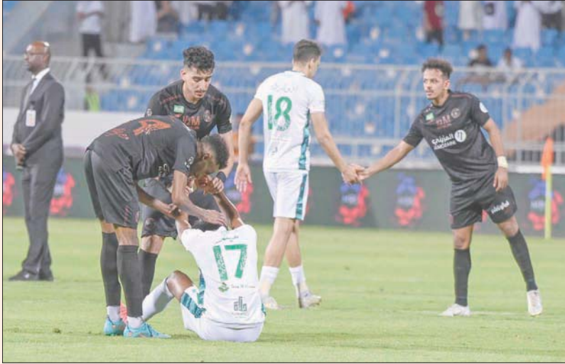
هبوط الأهلي كان وما زال حديث الشارع الرياضي السعودي

النفيعي، عبر حسابه الشخصي على «تويتر» مطالبة بإجراء تحقيق في هبوط الفريق لدوري