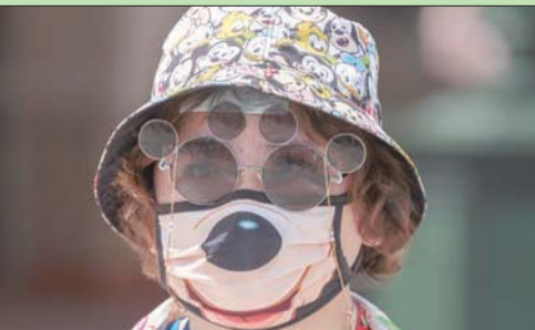
زائر في «ديزني لاند» شنغهاي بالصبين

الجذب، مثل منطقة (عالم مارفل)، ستبقى مغلقة. وجدير ذكره، أن «ديزني لاند» شنغهاي مشروع مشترك مع مجموعة شندي الصينية المملوكة للدولة ولديها حصة تبلغ 57 في المائة.