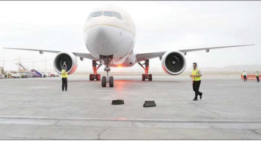
شركة التأجير الجديدة ستسعى للتوسع بما يتيح لها الاستفادة من شراء الطائرات وإعادة تأجيرها (الشرق الأوسط)

بشكل مباشر وغير مباشر حتى نهاية 2021؛ مما يسهم في دفع عجلة تحول الاقتصاد السعودي وتنويعه، إلى جانب إسهامه في تشكيل ملامح مستقبل الاقتصاد العالمي. ويشهد الصندوق السيادي السعودي تحركات كبيرة مؤخراً لتحقيق مستهدفاته المرتكزة على الاستثمار في الفرص الواعدة محلياً ودولياً، حيث أطلق مؤخراً الشركة السعودية للقهوة بهدف تمكين نمو قطاع الأغذية والزراعة في البلاد، والمساهمة في رفع القدرة الإنتاجية للبن السعودي إلى 2500 طن سنوياً.