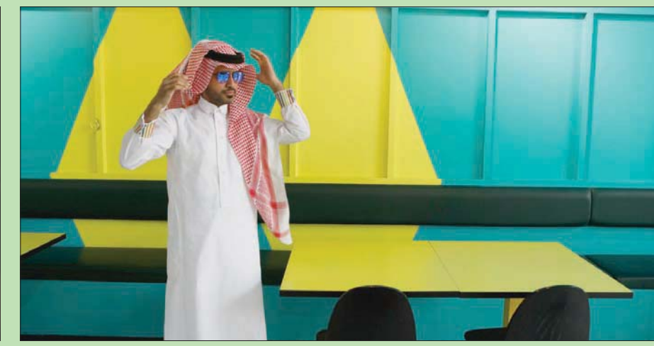
مشروع «سعودي بوب» يستطلع تغير معيشة وملابس السعوديين (الشرق الأوسط)

عودة للجدابة، فلقد نشأت علاقة المصور هشام الحميد مع التصوير من باب الصدفة، عام 2008، حيث توقف حينها عن الدراسة لمدة شهرين، وحاول شغل وقت فراغه بهواية تفيد، ليقرر اقتناء أول كاميرا في ذلك الوقت، وخلال هذه الفترة كان يخرج للتصوير بشكل يومي، إلى أن تعلق بالكاميرا وعالم التصوير أكثر. ويشير الحميد إلى أنه بدأ احتراف هذا المجال عندما سلك مساره الخاص، وتحديداً تصوير السفر، عام 2012، أي بعد 4 سنوات من ممارسة جميع أنواع التصوير، كما يقول مضيفاً «تصوير السفر لم يكن ثقافة منتشرة بشكل كبير في ذلك الوقت بين المصورين في مجتمعنا العربي، فكثير من المصورين يقوم بالتقاط بعض صور السفر خلال رحلته السياحية، أما عن الرحلات التي أخوضها فهي تكون لوجهات غير مرغوبة بالغالب، وليست مهياة سياحياً».