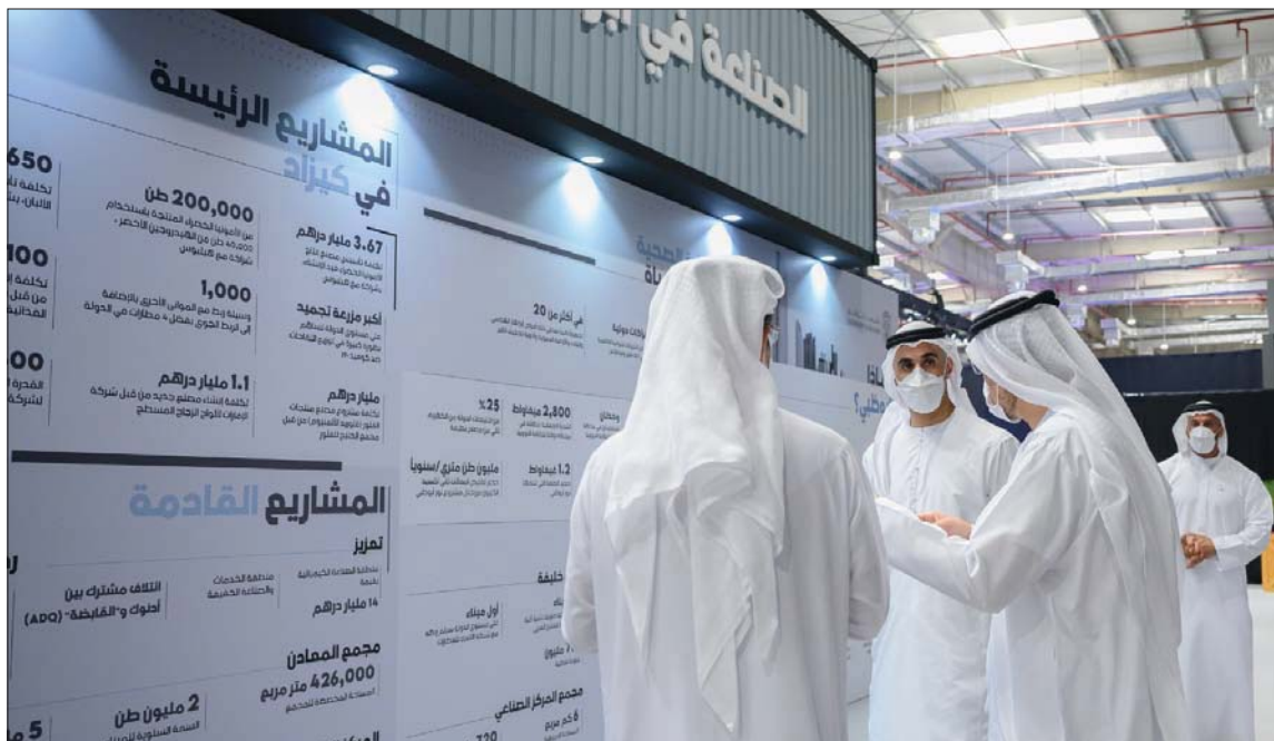
تم الإعلان عن استراتيجية أبوظبي الصناعية خلال حدث متخصص بحضور الشيخ خالد بن محمد بن زايد آل نهيان (وأم)

برامج تسعى إلى دفع عجلة التنمية وتعزيز الابتكار وصلف المهارات وبناء منظومة متكاملة لشركات ومؤسسات التصنيع المحلية وزيادة حجم تجارة إمارة أبوظبي مع الأسواق العالمية وتسهيل عملية الانتقال إلى الاقتصاد الدائري. وستعمل مبادرة الاقتصاد الدائري على تعزيز النمو الاقتصادي المستدام من خلال رفع مستوى المسؤولية في الإنتاج والاستهلاك، مع إعداد إطار تنظيمي للاقتصاد الدائري لمعالجة الثغرات وإعادة التدوير وترشيد الاستهلاك، في الوقت الذي ستعمل مبادرة الثروة الصناعية الرابعة على دفع عجلة النمو الاقتصادي من خلال دمج التقنيات والسياسات المتقدمة لتعزيز التنافسية والابتكار. فيما تشتمل عوامل تمكين