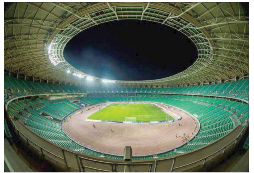
التقرير الميداني كشف عن جاهزية البصرة لاستضافة كأس الخليج المقبلة

يذكر أن بطولة كأس الخليج العربي لكرة القدم تقام مرة كل عامين، وأقيمت أول نسخة في البحرين عام 1970، والنسخة الأخيرة في قطر 2019، وتحمل الكويت الرقم القياسي في عدد مرات الفوز في البطولة الخليجية (10 القاب) مقابل 3 القاب لكل من قطر والسعودية والعراق، وفازت كل من عمان والإمارات باللقب مرتين، والبحرين مرة واحدة. يشار إلى أن البطولة تاجلت لأكثر من مرة في ظل الظروف المتلاحقة التي اجتاحت العالم إثر تفشي جائحة فيروس كورونا، إضافة إلى المنافسات القارية بتصفيات كأس العالم في قطر 2022 وكأس آسيا وكأس العرب التي أقيمت في العاصمة القطرية الدوحة نهاية العام الماضي.