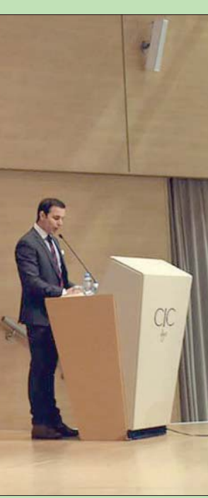
رئيس الوزراء المصري والوزير الأول الجزائري في الجزائر أمس

وخلال اللقاء أكد مدبولي «ضرورة العمل على الحفاظ على روية عقد اجتماعات اللجنة لا سيما في ظل ما توليه قيادتنا البلدين، الرئيس عبد الفتاح السيسي وأخوه الرئيس عبد المجيد تيون من اهتمام بالغ بتعزيز وتطوير علاقات التعاون بين البلدين الشقيقين، وتأكيدهما مؤخراً على ذلك خلال زيارة الرئيس تيون لمصر في يناير (كانون الثاني) الماضي». وتشمل الوفد المصري وزراء الكهرباء والطاقة المتجددة، والبترو