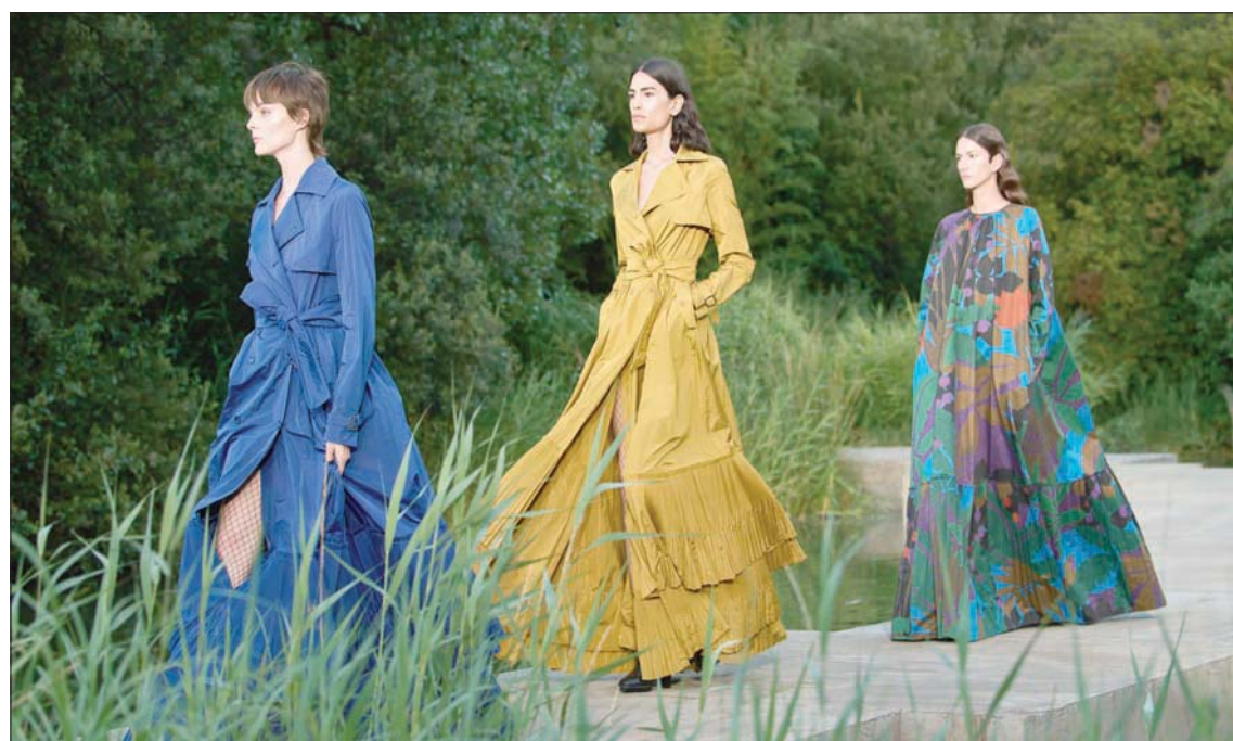
قدم المصمم مجموعة عصرية وأنيقة من فساتين السهرة والمساء

والوانها ونقشاتها، تشد على الجسم فتداعى تغطيه، لكنها في الوقت ذاته تمنحه أنوثة مفعمة بشاعرية عززتها نسائم الهواء المسائية فجعلتها تتناثر فتبرز التفاصيل الكامنة بين فئانيها وجوانبها.