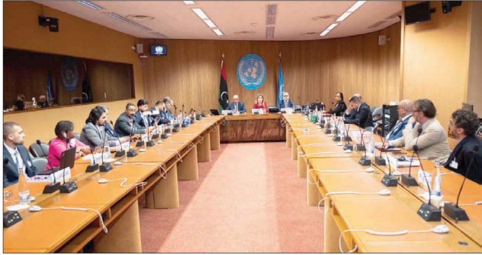
جانب من محادثات صالح والمشري في جنيف حول القاعدة الدستورية للانتخابات الليبية

عجز رئيسا مجلسي النواب و«الدولة» في ليبيا في ختام محادثتهما على مدى الأيام الثلاثة الماضية بمدينة جنيف السويسرية، في حسم الخلافات العالقة حول القاعدة الدستورية المنظمة للانتخابات الرئاسية والبرلمانية المؤجلة، ومصير حكومتي «الوحدة» و«الاستقرار» المتنازعتين على السلطة بالبلاد. وقالت مصادر برلمانية إن عقيلة صالح، رئيس مجلس النواب، غادر مع الوفد المرافق له مقر إقامته في جنيف، تعبيرا عن فشل المفاوضات المتكثفة، مع خالد المشري رئيس مجلس الدولة، بشأن القاعدة الدستورية والسلطة التنفيذية.