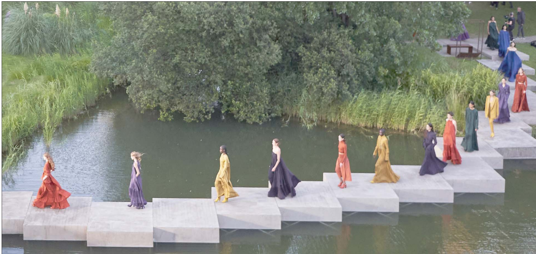
كانت حديقة مؤسسة «كالوست كولبنكيان» مسرح العرض (الشرق الأوسط)

كانت القصة كما كتبها إيان مقسمة ثلاثة فصول: الفصل الأول بدأ بإيقونات الدار، مثل معطف بلون الكاراميل ثم جاكيتات باطوال مختلفة نسقها مع تنورات مستقيمة تُحدد الجسم، لكن لا تقيده. والفصل الثاني عبارة عن بليسيهات تحدد الخصر وتُغني عن أي حزام، تم تنسيقها مع كزات ضيقة وقصيرة إلى جانب «تي - شيرتات» طرزتها أنامل حرقبات من لشبونة جسدت فيها الدار كل رموز الحب والأمل، مثل صور الحمام والقلوب والورود، وهي تطريزات استوحاها المصمم من مناديل كانت تطرزها النساء ويُلوحن بها نحو السفن وهي تغادر الميناء وعلى متنها أزواجهن أو أحبتهن. وأخيراً وليس آخراً، مجموعة من فساتين السهرة والمساء سخية باقمشتها