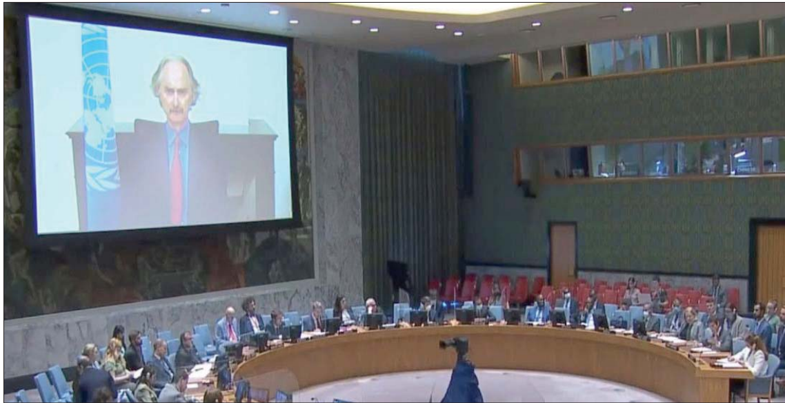
بيدرسن متحدثاً عبر الفيديو إلى مجلس الأمن

تمكين السوريين من العودة إلى حياتهم الطبيعية وتوجيه طاقاتهم وإمكاناتهم نحو عملية بناء مستقبل سوريا واستقرارها وتقدمها». وطالب الدول التي «تتمتع اللاجئين السوريين من العودة لوطنهم» بأن ترفع أيديها وتتحقق عملاً وصفه بوضع العراقيل أمام عودتهم.