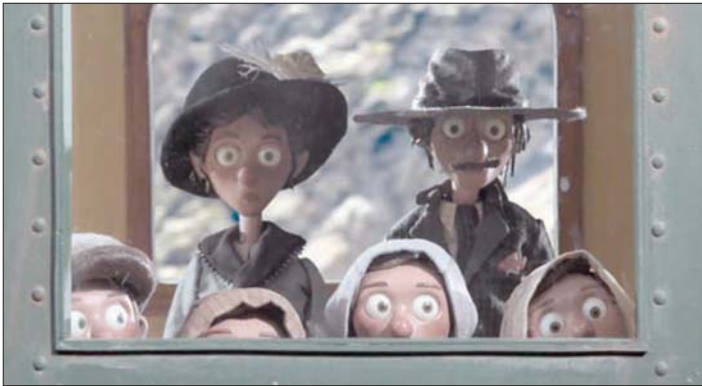
«لا كلاب ولا إيطاليين مسموح لهم»

ميغيل ريبيرو. هذا أول فيلم له وأسلوب عمله ليس مبهراً، بل يعكس مناعب في كيف يمكن للفيلم وحكايته الانتقال من حالة الإحداث في أنغولا سنة 1995 من ثم تنتقل إلى الزمن الحالي. في حرب أهلية، وفي الزمن الحاضر هناك بحث لامرأة عن زوجها الذي اختفى منذ ذلك الحين.