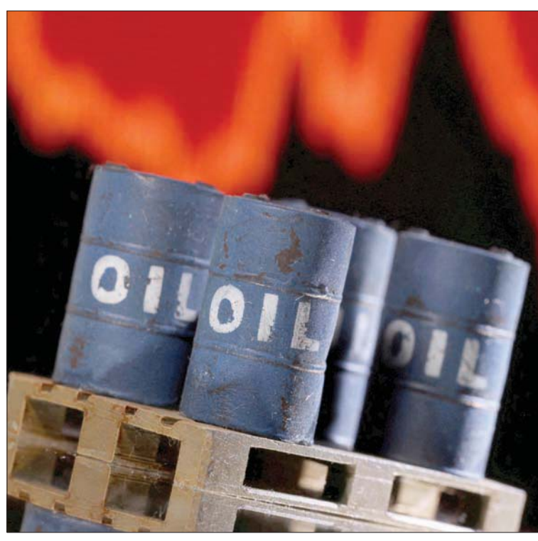
أبقت «أوبك بلس» على هدفها المتمثل في زيادة طفيفة للإنتاج لهذا الصيف

مدى أشهر لضخ مزيد من النفط من الدول الأعضاء في «أوبك بلس» والتي تضم الأعضاء في منظمة «أوبك» وصعدت أسعار النفط إلى أعلى مستوياتها منذ عام 2008 حيث قفزت فوق 139 دولاراً للبرميل في مارس (آذار) بعد أن فرضت الولايات المتحدة وأوروبا عقوبات على روسيا بسبب غزوها لأوكرانيا وهو تحرك تصفه موسكو بأنه «عملية عسكرية خاصة»... وتراجعت الأسعار منذ ذلك الحين لكنها لا تزال تزيد على 115 دولاراً يوم