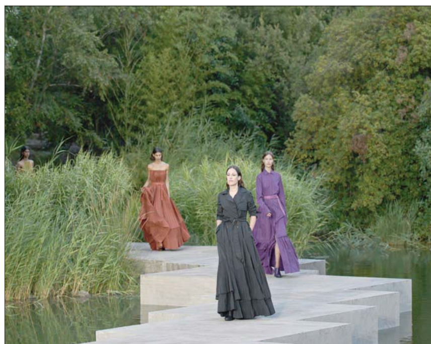
مغنية الغادو كارمينيو شاركت كعارضة بفستان أسود طويل تزينه بليسيهات دقيقة

لا يخفي إيان أن الجانب الشعاري للمدينة وموسيقى الغادو بكل ما تتضمنه من لوعة الحب والغد من العناصر التي حفزته، لكن بالنسبة للمتابع، فإن المُهم الأكبر كان مؤسسة «كالوست كولبنكيان»، كمعمار ومحتوى على حد سواء، وذلك أن جولة سريعة للشبونة تؤكد أنها لا تفقد إلى مباني باروك أو قصور وكاتدرائيات من زمن ماضٍ أو تم