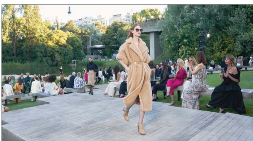
أخذ المعطف الأيقوني مركز الصدارة كالعادة

لم تكن السوان الأبيض والأسود ولا حتى البني بدرجات الكارميل والبيج الصبيح بالدار هي الغالبة، فقد كانت هناك ألوان أخرى مثل البنفسجي والأخضر والبرتقالي المحروق والأزرق، وهلم جزاً. لم يضاه تنوع الألوان والتصاميم سوى تنوع الأقمشة التي تباينت بين الكشمير والتافتا والجريسيه والحبر. وطبعاً كان لا بد أن يأخذ المعطف الأيقوني الصدارة في شد انتباهه، رغم أن عدده كان قليلاً، لكن إيان ضحَّه بجرعة أكبر من الفخامة هذه المرة بإضافة تطريزات وترصيعات من براءة، مثل واحد استوحاه من معطف من فرو المينك كان لا يفارق المغنية أماليا رودريغيز في الأيام الباردة والأسبقيات الخاصة وتزينه ببروشات حسب المناسبة. ما كان مثبثاً في العرض أيضاً، ظهور عارض معطف الدار الأيقوني، 10810. كان هذا أول ظهور لرجل في عرض من عروض «ماكسمارا»: «لهذا كان من البديهي أن نفكر بأن الدار ربما تنوي اقتحام مجال الأزياء الرجالية وتحاول جس النبض. عند سؤاله، يُنفي غريفيث الأمر تماماً، لكنه يشرح بأن المعطف الذي أبدعه في عام 1981 ولا يزال تعويذة الدار الناجحة، ليس له جنس محدد، وهو ما يجعله مناسباً للرجل أيضاً. أما ولأوه فسبقي للمرأة أولاً وأخيراً.