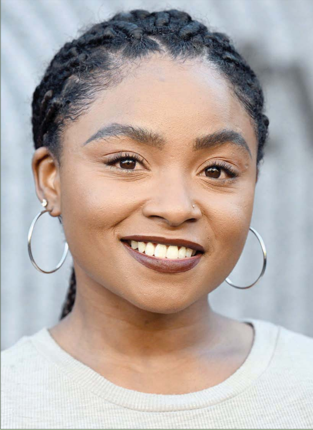
المثلة جانيث غودلوك لدى حضورها العرض الأول لفيلم «بلاك بيرد» في لوس أنجلوس بكاليفورنيا

تذكر، كما يقول الوزير المصري منير فخري عبد النور، حينها، كيف أن الاتحاد الأوروبي وأميركا ضغطا بشراسة على القوى المدنية من أجل التعاون مع جماعة «الإخوان» خلال الشهر الأخير من حكم مصر. لقد نجت مصر من مكر الليل والنهار وتحالف دولي رهيب كان يريد إهداء مصر لجماعة «الإخوان» ومن يستخدم هذه الجماعة لحاجبة في نفاس يعقوب، وأربنا كيف سلموا أفغانستان، بالمفتاح، لطالبان، بكل قلب بارد! لكن مصر كان لها رأي مختلف... لذلك من المهم إغناء الذاكرة وإنعاشها كل حين حتى لا يخرج لنا من يعيد الكرة... بشعار جديد.