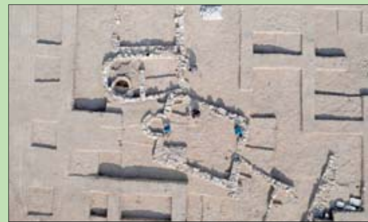
عمال الآثار يعملون في موقع اكتشفت به آثار مسجد قديم كبير عمره 1200 سنة

كثير من المسيحيين إلى مسجد ريفي آخر من القرن السابع، تم الكشف عنه خلال حفريات عام 2019». وقالت عالمة الآثار الدكتورة إيلانا كوغن التي أدارت عملية الحفريات سوياً مع نواح ميخائيل ديفيد وأورين شموييلي، إن هذه الحفريات تشير إلى الحقبة التي تميزت فيها البلاد بظاهرة تحول