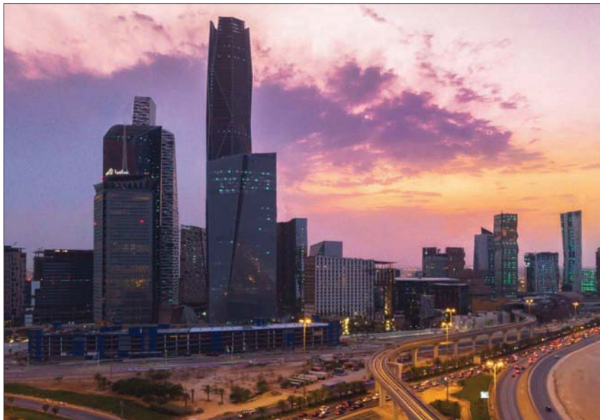
صندوق النقد يؤكد تجاوز السعودية للمخاطر الاقتصادية الناتجة عن الحرب الروسية - الأوكرانية (الشرق الأوسط)

وتؤكد مضمين بيان خبراء صندوق النقد الدولي متانة اقتصاد المملكة وقوة وضعها المالي، ويعكس الجهد الكبير الذي تبذره الحكومة في المضي بإصلاحاتها الاقتصادية في ظل «رؤية 2030»، بما في ذلك تحسين بيئة الأعمال وتبسيط القواعد التنظيمية ورقمنة العمليات الحكومية، إضافة إلى عملها على مجموعة واسعة من المشاريع في عدد من القطاعات من ضمنها البنية التحتية والخدمات اللوجيستية والترفيه والسياحة والتعدين، وكذلك الجهود الكبيرة التي تبذلها القيادة في القطاع المالي لدعم التقنية المالية. ورحب الصندوق بالترام المالية بالحفاظ على استدامة المملكة العامة وبالجهود المبذولة لتجنب مسايمة اتجاهات الدورة الاقتصادية بوضع سقف للإنفاق لا يتأثر بتقلبات أسعار النفط.