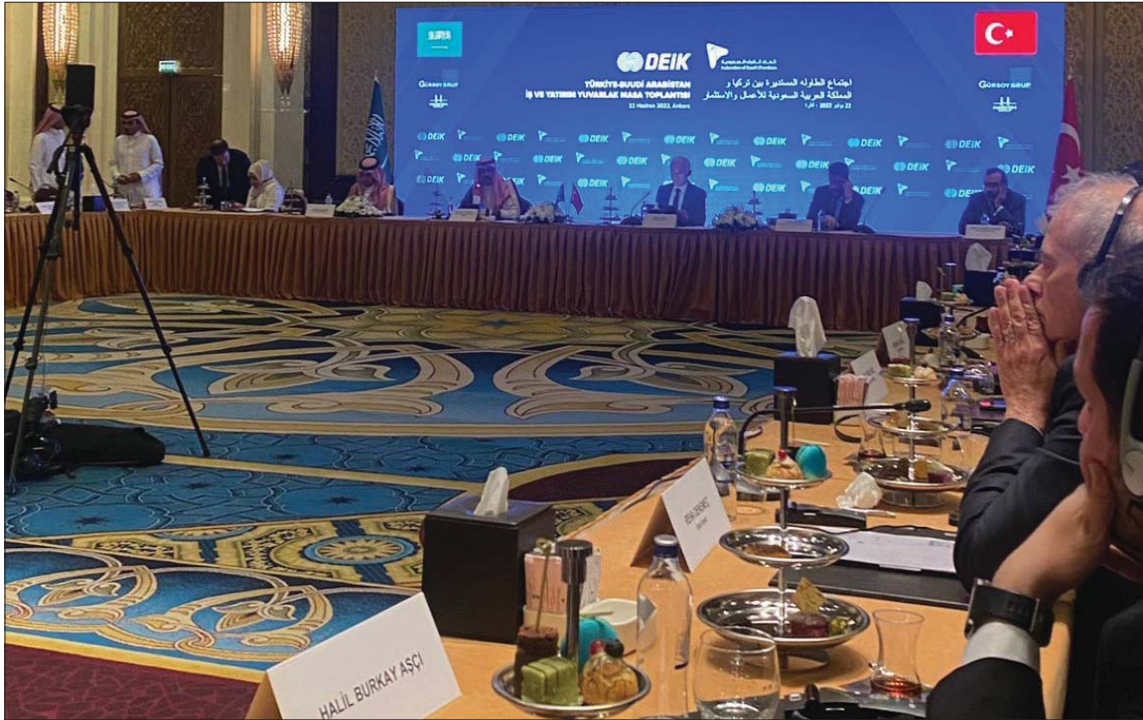
جانب من اجتماع رجال الأعمال السعوديين والأتراك في تركيا أمس

وزاد أن أهم الاتفاقيات المحتملة هي توسيع حجم التجارة والتعاون في كل مجال تقريباً ومجالات السياحة، مشيراً في حديث لـ «الشرق الأوسط» إلى أن «النقطة الأكثر أهمية هي أن هناك المئات من الشركات والأنشطة الشخصية مدعومة باتفاقيات ثنائية ومبادرات فردية، من الطاقة إلى البنية التحتية للاتصالات