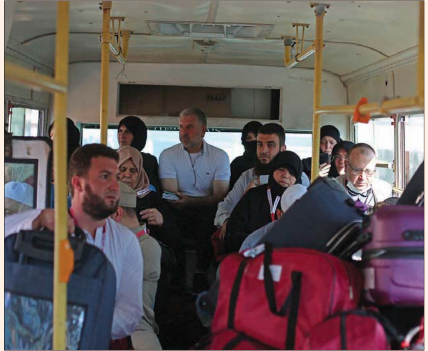
سوريون عند معبر باب الهوى يستعدون للعبور إلى تركيا أمس في طريقهم لأداء فريضة الحج