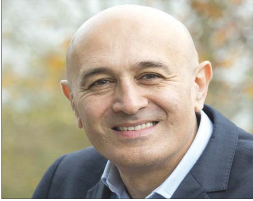
صورة من موقع جامعة Surrey لجيم الخليلي

كhalili، عراقي المولد وبريطاني الجنسية، الذي صار أحد أقطاب تبسيط العلم ونشر المعرفة العلمية على مستوى العالم عبر كتبه ووثائقياته وحواراته الكثيرة فضلاً عن برنامجه ذائع الصيت «LifeScientific» الذي تبثه قناة «BBC». كمن قد عرضت سابقاً في «الشرق الأوسط» قراءة في كتابه «العالم كما تفهمه الفيزياء» الصادر عام 2020 عن دار نشر جامعة «برينستون» الأميركية، ويمكن للقارئ الشغوف مراجعة تلك المادة لكي يتعرف أكثر على شخصية الخليلي ومؤلفاته. يواصل الخليلي جهوده التأليفية الحديثة، وكان من نتائج تلك الجهود أن نشرت له جامعة «برينستون» قبل بضعة أسابيع (بالتحديد يوم 12 أبريل «نيسان» 2022) كتابه الأحدث الذي اختار له عنوان «بهجة العلم» The Joy of Science.