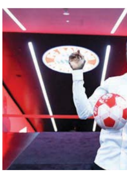
ماني يستعرض بالكرة في ممر ملعب أرينا

من جهته، قال حمديتش: «نحن فخورون بضمه إلى بايرن ميونيخ. ماني إضافة مثالية للفريق الذي يتطلع إلى التوقيع بمزيد من الألقاب في ألمانيا وأوروبا». وأضاف: «الجميع يعرفون قدراته الفنية الهائلة، وكذلك عقليته المنهضة. سيسهم