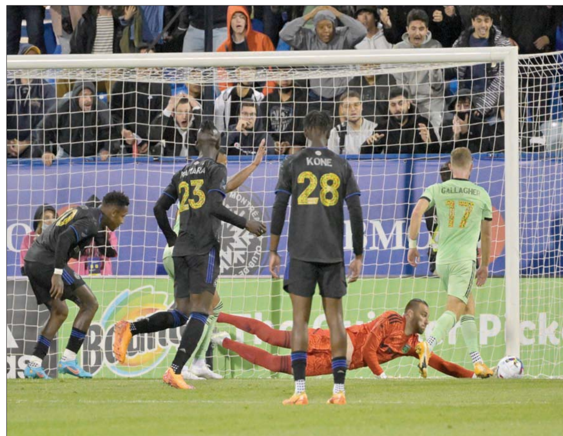
لقطة من مباراة أوستين تكساس ومونتريال بالدوري الأميركي

من المؤكد أن المشجعين سيلاحظون الفرق؛ حيث ستقام جميع المباريات يومي السبت والأربعاء، وستكون عمليات البث المحلية شيئاً من الماضي، وكذلك الحال مع حالات انقطاع البث؛ حيث ستذاع كل المباريات في كل الولايات (وفي كل البلاد) على «أبل تي في». وسيتم بث المباريات بدقة عالية الجودة (1080 بكسل بدلاً من البث الحالي بجودة 720 بكسل)، وسيكون هناك خيار صوت راдио محلي. علاوة على ذلك، سيحصل حاملو التذاكر الموسمية لمباريات الدوري الأميركي لكرة القدم على إمكانية الوصول إلى الخدمة مجاناً.