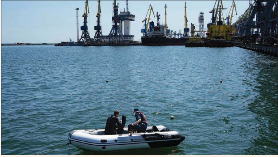
غادرت أول سفينة تركية محملة بالحبوب أمس ميناء ماريوبول الأوكراني الخاضع لسيطرة الجيش الروسي والانفصاليين

وأنه من المتوقع شحن ما بين 30 و35 مليون طن من الحبوب من هناك في غضون 6 إلى 8 أشهر. وتجري الأمم المتحدة مفاوضات منذ أسابيع مع روسيا وأوكرانيا للتوصل إلى اتفاق يسمح بإخراج الحبوب من أوكرانيا وعودة الأسمدة المنتجة في روسيا إلى السوق الدولية، لكن لم تقض المحادثات إلى اتفاق بعد.