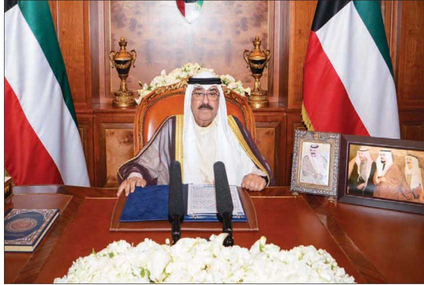
الشيخ مشعل الأحمد الصباح خلال توجيهه كلمة متلفزة نيابة عن أمير الكويت أمس

نحل مجلس الأمة حلاً دستورياً، والدعوة إلى انتخابات عامة وفقاً للإجراءات والمواعيد والضوابط الدستورية والقانونية». مشعل الأحمد الصباح، أمس، حل مجلس الأمة (البرلمان) حلاً دستورياً، والدعوة لانتخابات عامة جديدة، وسط أزمة سياسية حادة مستحكمة تعقدها البلاد منذ استقالة الحكومة قبل شهرين. وجه ولي العهد الكويتي كلمة متلفزة إلى الشعب؛ نيابة عن أمير البلاد الشيخ نواف الأحمد الجابر الصباح، حيث أعلن فيها حل مجلس الأمة حلاً دستورياً، والدعوة لانتخابات عامة خلال الأشهر القادمة». وبارك الأمير الشيخ نواف الأحمد قرارات ولي العهد بكلمة مقتضبة متلفزة استيق بها حديث الشيخ مشعل قائلاً: «لقد كلفت أخي سمو ولي العهد الأمين بإلقاء كلمة نيابة عننا، والتي نأمل أن توضح كل ما يدور على الساحة؛ فنحن على دراية تامة ومتابعة للمشهد السياسي». وقال ولي العهد الكويتي «قررنا الاحتكام للدستور وحل مجلس الأمة حلاً دستورياً، والدعوة لانتخابات عامة خلال الأشهر القادمة». وأضاف «رأينا أن الخروج من المشهد السياسي الحالي بكل ما فيه من عدم توافق وعدم تعاون، واختلافات وصراعات، وتغليب المصالح الشخصية وعدم قبول البعض للبعض الآخر، وممارسات وتصرفات تهدد الوحدة الوطنية (...) فقد قربنا اللجوء إلى الشعب باعتباره المصير والامتداد والبقاء والوجود ليقوم بنفسه بإعادة تصحيح مسار المشهد السياسي من جديد بالشكل الذي يحقق مصالحه العليا». وأعلن عن تفعيل المادة (107) من الدستور بحل مجلس الأمة حلاً دستورياً، والدعوة لانتخابات عامة جديدة، وقال «بناءً عليه؛ فقد قررنا مضطرين ونزولاً على رغبة الشعب واحتراماً لإرادته الاحتكام إلى الدستور والعمل الذي ارتضيته، واستناداً إلى حقنا الدستوري المخصوص عليه في المادة (107) من الدستور أن