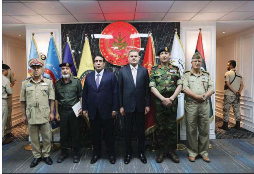
صورة وزعتها حكومة الدبيبة لافتتاحه مع المنفي القر الجديد لرئاسة أركان قواتها بطرابلس

عاد الهدوء الحذر إلى العاصمة الليبية طرابلس، أمس، بعد ساعات من التحشيد الأمني المستمر. وفيما دعا فتحي باشاغا، رئيس حكومة «الاستقرار» الجديدة، الجهات الرسمية للامتناع عن التعامل مع حكومة «الوحدة» المؤقتة، برئاسة غريميه عبد الحميد الدبيبة، باعتبارها «متهينة المصالحة»، دشّن الأخير مقراً لرئاسة أركان قواته.