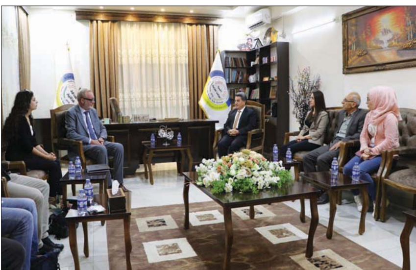
صورة وزعتها «الإدارة الذاتية» لمبعوث بلجيكا الخاص لسوريا هوبير كورمان في القامشلي الثلاثاء،

العناصر. وكبرت الإدارة الذاتية وقادة «قسد»، أن ملف المحتجزين الأجانب وعائلاتهم بشكل عبثاً كبيراً على الإدارة، وطالبت مراراً ببلدانهم باستعادتهم ومحاکمتهم على أراضيها. وعلى رغم هذه الدعوات، تتردد غالبية الدول الأوروبية في استعادة جميع مواطنيها. وفي الوقت ذاته، قال الدكتور عبد الكريم عمر، رئيس دائرة العلاقات الخارجية لدى الإدارة الذاتية، لـ «الشرق الأوسط»، إن التهديدات باجتياح مناطق شمال سوريا تزيد من التحديدات التي تواجهها الإدارة» ويمكن أن تعطى تنظيم «داعش» فرصة لإعادة تنظيم نفسه من جديد ومحاولة السيطرة على بعض المناطق الجغرافية.