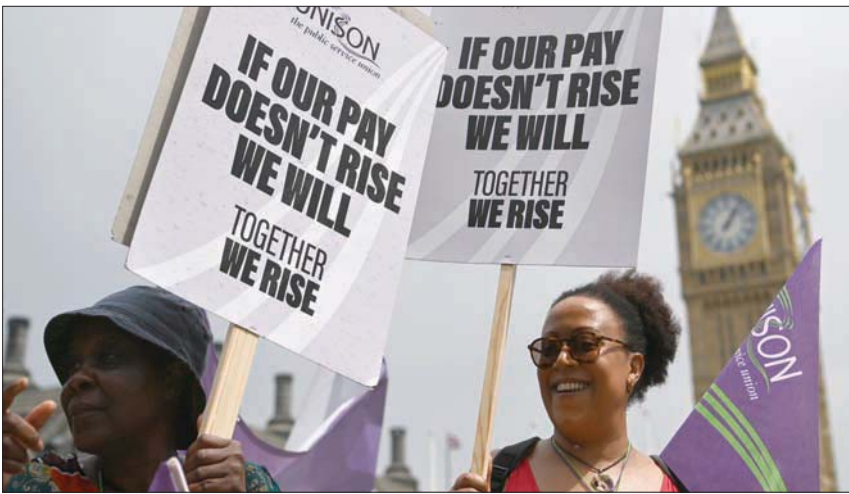
تزايد الإضرابات في بريطانيا للمطالبة بزيادة الأجور وسط تضخم هو الأعلى في 40 عاماً

البريطانية بالفعل بـ«صيف السخوط»، ما يثير ذكري «شقاء السخوط» في الفترة 1978-1979 عندما تعرضت البلاد لإضرابات واسعة النطاق أدت إلى سقوط الحكومة العمالية آنذاك. وكان أكثر من مليون من ركاب المواصلات العامة في العاصمة البريطانية لندن قرروا البقاء في منازلهم يوم الثلاثاء خلال فترة إضراب عمال السكك الحديدية الذي أدى إلى توقف حركة مترو لندن في العاصمة بشكل شبه كامل. وأفادت بلومبرغ بأن رحلات مترو الأنفاق تراجعت بنسبة 95 بالمائة صباح الثلاثاء بعد إضراب نحو 10 آلاف من عمال المترو، الذين انضموا إلى إضراب زملائهم في السكك الحديدية للمطالبة بتسريع زيادات في الرواتب نواكب وتيرة التضخم خلال المفاوضات في الصيف. وعلى نحو منفصل، قالت نقابة عمال الاتصالات على تويتر إنها سوف تستطلع آراء عمال البريد البالغ عددهم 115 ألفاً من ذلك جنسياً إلى أن نحو نصف مقترحة تتعلق بالرواتب، حسبما ذكرت وكالة بلومبرغ للأنباء. ويهدف الإضراب إلى العمل بنظام يوم الخمس والسبت المقبلين.