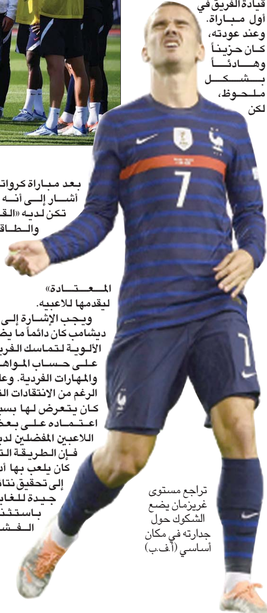
تراجع مستوى غريزمان يضع الشكوك حول جدارته في مكان أساسي

2,5 مليار دولار لبت المباريات عبر الخدمة الرقمية المباشرة