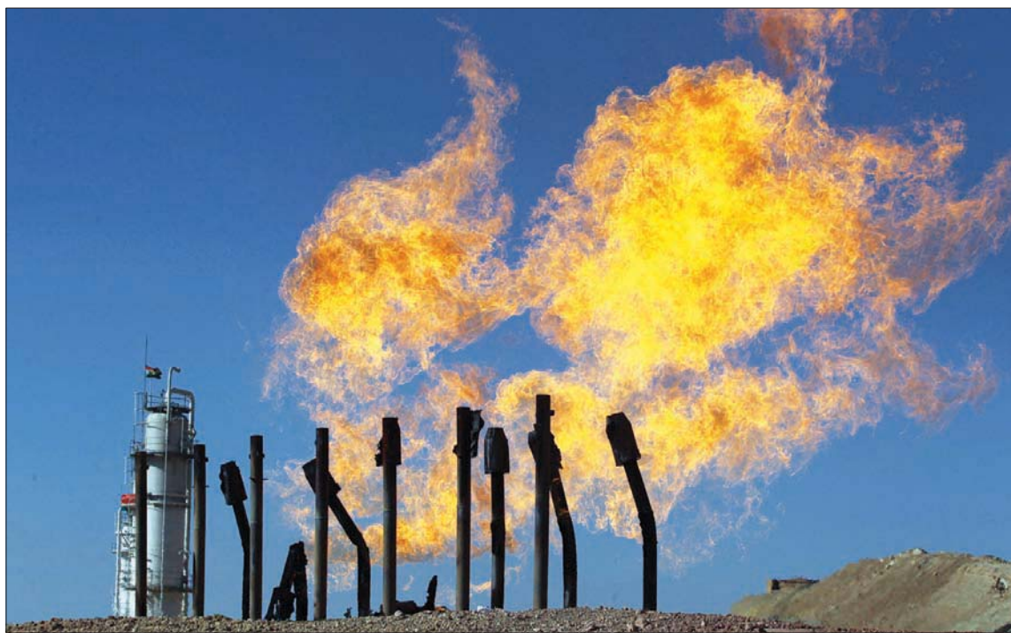
أرشيفية لأحد حقول الغاز غربي مدينة كركوك حيث سقط صاروخ كاتيوشا بالقرب من مجمع خور مور للغاز في إقليم كردستان

وبينما يتحول «الإطار التنسيقي» الشعبي إلى كتلة برلمانية كبيرة حين تنضم إليها الغالبية العظمى من النواب البدلاء، وبالتالي تصح هي أعضائها رئيساً للحكومة المقبلة، فإن حلطي الصدر: تحالف «السيادة» السني بزعامة محمد الحلبوسي رئيس البرلمان، والحزب الديمقراطي الكردستاني بزعامة مسعود بارزاني، لم يحصما أمرهما بعد لجهة حضور الجلسة من عدمه، أو الانتقال لجهة التحالفات من مركب الصدر إلى مركب خصومه، قوى «الإطار التنسيقي». وطبقاً لما باتت تعلمه أوساط كل من التحالفين السني والكردي، فإن تحالف «إنقاذ وطن» المكون من «الكتلة الصورية»، و«السيادة»، والحزب الديمقراطي الكردي»، لا يزال قائماً رغم انسحاب الصدر. وبين أن يكون الإعلان عن بقاء هذا التحالف قائماً مجرد مناورة، وبالتالي ورقة تفاوضية