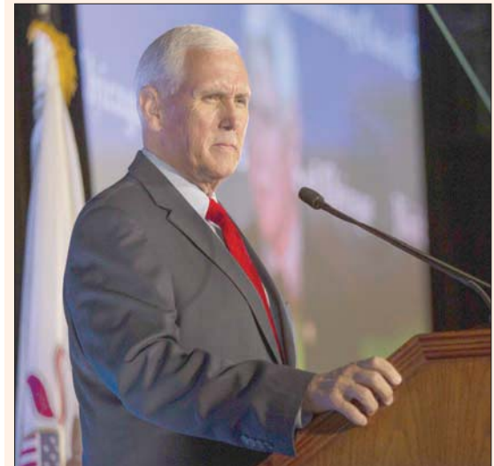
بنس يلقي خطاباً في نادي جامعة شيكاغو الاثنين الماضي

في خضم جلسات الاستماع التي تعدها لجنة التحقيق في أحداث 6 يناير (كانون الثاني) 2021، والهجوم على مبنى الكابيتول، بدأ إن نائب الرئيس الأميركي السابق مايك بنس يسعى إلى إخراج نفسه من تداعيات هذه الأحداث، داعياً الجمهوريين إلى «التركيز على المستقبل»، وليس على «تزيير الانتخابات»، في إشارة غير مباشرة إلى تركيز الرئيس السابق دونالد ترمب المستمر على خسارته انتخابات 2020. ويواصل بنس جولاته في كثير من الولايات الأميركية، وقال في خطاب اقتصادي أمام جمهور من مؤيديه في نادي جامعة شيكاغو بولاية إلينوي: «القد مررتنا جميعاً بكثير خلال السنوات الأخيرة الماضية، جانحة عالمية، واضطراب اجتماعي، وانتخابات مثيرة للانقسام، ويوم ماسوي في عاصمتنا، وإدارة على ما يبدو تدفع اقتصادنا كل يوم إلى هاوية دولة الرفاهية الاشتراكية». وأضاف: «في الأيام الممتدة من الآن حتى يوم الانتخابات، دعونا نلقي برؤية إيجابية لمستقبل الشعب الأميركي... نعم، لكن المعارضة الموالية. دعونا نحل الجانب الآخر المسؤول في يوم. الآن ويوم الانتخابات، تريد أن تقول نعم للمستقبل، نعم للمستقبل الحرة وقيمنا العزيزة، والحزب الجمهوري يجب أن يكون حزب المستقبل... ومع أن بنس لم يصح صراحة إذا كان سترشح للانتخابات الرئاسية، فإن كلماته تشير بشكل واضح إلى أنه مرشح إلى حد كبير، وليس شخصاً مهتماً بمناقشة تفاصيل ما عاشه من أحداث ذلك اليوم المشؤم.