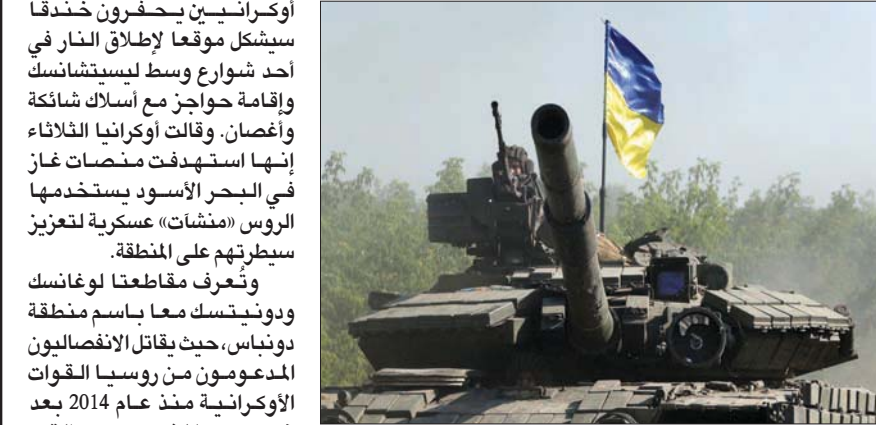
قالت كييف إن الضربات الروسية «تدمر كل شيء» في ليشيتشيانك

أوكرانيين بحفرون خندقاً سيشكل موقعا لإطلاق النار في أحد شوارع وسط ليشيتشيانك وإقامة حواجز مع أسلاك شائكة وأغصان، وقالت أوكرانيا الثلاثاء إنها استهدفت منصات غاز في البحر الأسود باستخدامها الروس «مشتات» عسكرية لتعزيم سيطرتهم على المنطقة. وتعرف مقاطعة لوغانسك ودونيتسك معا باسم منطقة دونباس، حيث يقطن الانفصاليون المدعومون من روسيا القوات الأوكرانية منذ عام 2014 بعد ضم روسيا لشبه جزيرة القرم من أوكرانيا. وقال زيلينسكي: «وبنفس القدر من الفاعلية التي تناضل بها من أجل اتخاذ الاتحاد الأوروبي قراراً إيجابياً بشأن حصول أوكرانيا على وضع مرشح، فإننا نكافئ أيضاً كل يوم ونحن لا نتوانى ليوم واحد». وحث الدول الداعمة لبلاده على تسريع تسليم السلاح، كما رحب بوصول الثلاثاء اتصالات الدفع لاستكمال المستمرة منذ أشهر لصالح روسيا في الأسابيع القليلة الماضية بسبب تفوقها الهائل في قوة نيران المدفعية، وهي حقيقة اعترف بها الرئيس الأوكراني فولوديمير زيلينسكي في خطاب الفاهة في وقت متأخر من ليل الثلاثاء، «بعزني الجيش الأوكراني دفاعاته في منطقة لوغانسك بفضل المناورات المتكيفة... هذه حقا أصعب بقعة. المحتلون يضعون بقوة أيضا في اتجاه دونيتسك». وتشهد منطقة لوغانسك منذ أسابيع من سفيرغودونيتسك في شرق البلاد، وكتب سيرغاسي غايداي حاكم منطقة لوغانسك حيث تتركز المواجهة بين الجيشين الروسي والأوكراني عبر تلغرام ليشيتشيانسك وسفيرغودونيتسك بالمدفعية والصواريخ والقنابل الجوية وقاذفات الصواريخ.