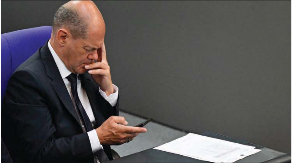
تلاحق المستشار الألماني أولاف شولتس اتهامات بعدم تقديمه الدعم الكافي لأوكرانيا... عسكرياً أو حتى سياسياً

السياسي في الخارجية الألمانية في الحكومة السابقة عندما كان هابكو ماس وزيراً للخارجية، ومثل ألمانيا في المفاوضات النووية التي جرت في فيينا مع إيران، وبعد فوز شولتس بمنصب المستشار، منح بلونتر ترقية ونقله إلى مقر المستشارية ليصبح مسؤولاً عن هندسة السياسات الخارجية للمستشار الألماني. وترأس بلونتر المفاوضات التي توسطت فيها ألمانيا قبيل الحرب في أوكرانيا، بين موسكو وكيف، في محاولة لإعادة إحياء اتفاقية مينسك. وفشلت الجولة الثانية من المفاوضات التي استضافتها برلين قبل أسبوعين فقط من بدء الغزو الروسي، واتهم دبلوماسيون أوكرانيون بلونتر آنذاك بالتحيز لصالح الوفد الروسي، وعندما سافر شولتس إلى كيف الأسبوع الماضي كان بلونتر إلى جانبه. ورغم أن الدبلوماسي البالغ من العمر 54 عاماً، يعد نفسه لا ينتمي لأي حزب، فهو تسليق سلم الدبلوماسية بفرض منحها مسؤولون من الحزب الاشتراكي الديمقراطي يدعاً بشتاينماير عندما كان وزيراً للخارجية، وكان بلونتر مستشاراً له عمل منذ ذلك الحين على تقوية العلاقات الروسية الألمانية.