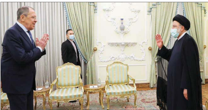
صورة وزعتها الرئاسة الإيرانية من استقبال رئيسي للافروف في طهران أمس