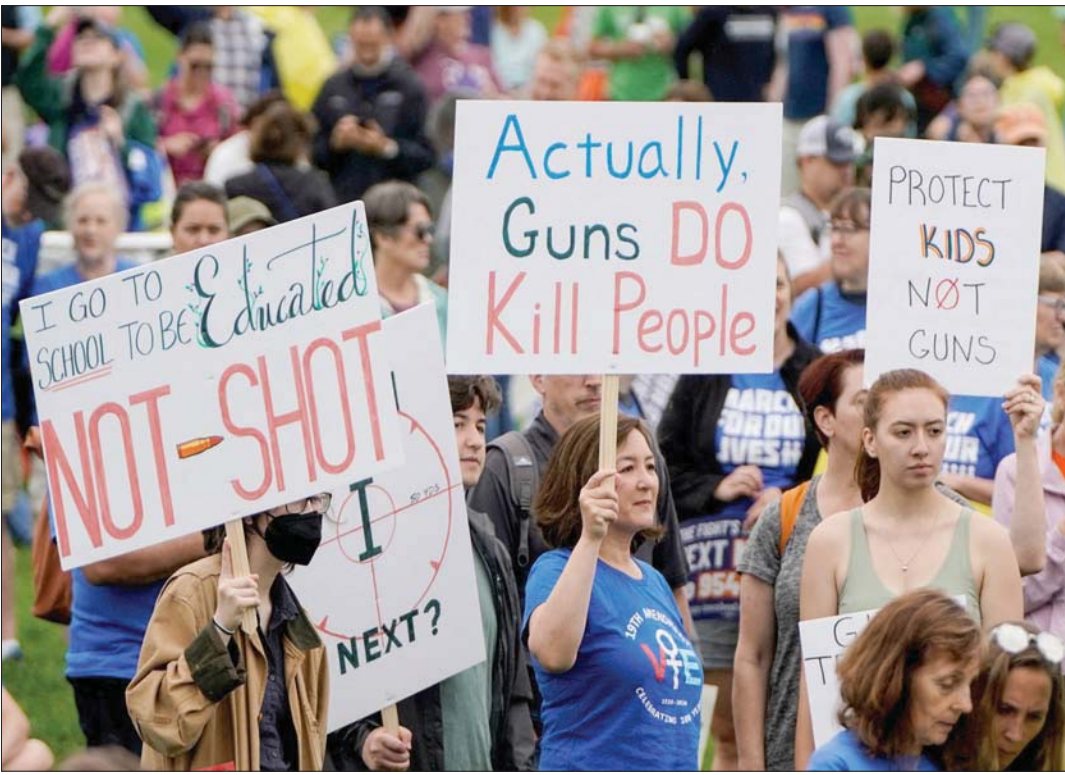
مظاهرة ضد السلاح في واشنطن في 11 يونيو الماضي