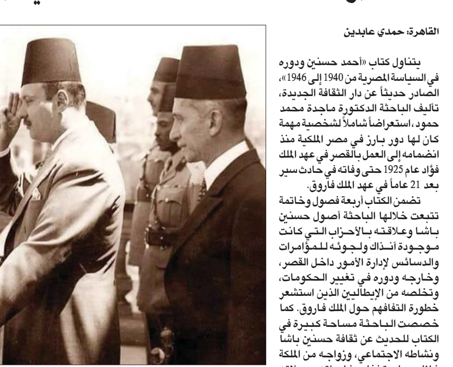
القاهرة، حمدي عابدين

يتناول كتاب «أحمد حسنين ودوره في السياسة المصرية من 1940 إلى 1946»، الصادر حديثاً عن دار الثقافة الجديدة، تأليف الباحثة الدكتور ماجدة محمد حمود، استعراضاً شاملاً لشخصية مهمة كان لها دور بارز في مصر الملكية منذ انضمامه إلى العمل بالقصر في عهد الملك فؤاد عام 1925 حتى وفاته في حادث سير بعد 21 عاماً في عهد الملك فاروق.