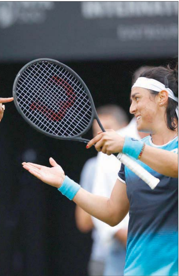
سيرينا وأنس جابر واحتفال بالانتصار في أول مباراة بالزوجي

لندن، «الشرق الأوسط» أعربت أسطورة التنس الأميركية سيرينا ويليامز المصنفة أولى عالمياً سابقاً، عن سعادتها بعودتها الناجحة إلى الملاعب بعد غياب عام بسبب الإصابة، والفوز مع شريكها التونسية أنس جابر في الدور الأول من منافسات الزوجي لدورة «إيستبورن» الإنجليزية الدولية على الملاعب العشبية والإعدادية لبطولة «ويمبلدون» مطلع الأسبوع المقبل. وتمكنت سيرينا البالغة من العمر 40 عاماً والمتوجة سبع مرات بلقب بطولة «ويمبلدون» آخرها عام 2016، وجابر الثالثة عالمياً، من تحويل تأخرهما بمجموعة إلى الفوز على التشيكية ماري بوزكوف والإسبانية سارا سوريبيس تورو 6 - 2 و 6 - 3 و 13 - 11. وبينما أكدت الالاعبة الأميركية البارزة من جديد حبها للعبة قالت إن مستقبلها في بطولات المحترفات لا يزال يكتنفه الغموض. ولم تلعب سيرينا الحاصلة على 23 لقباً في البطولات الأربع الكبرى أي مباراة رسمية منذ خروجها من