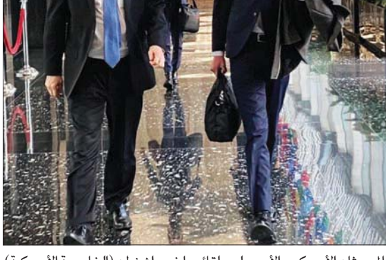
المبعوثان الأميركي والمبعوث الأممي لدى لقائهما في واشنطن