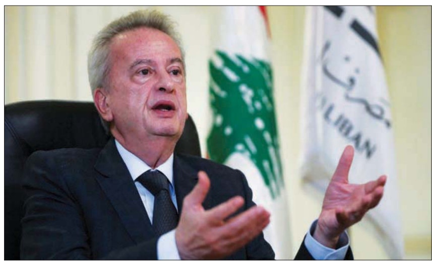
رياض سلامة

عون على المهني بملاحقته». وأضاف المحامي عقل «يفكي أنه ملاحق في سبع دول أوروبية، وهناك أكثر من عشرة مدعين عامين وقضاة تحقيق أجانب حركوا الدعاوى ضد سلامة، لا يمكن أن يكونوا مسيسين جميعاً. وكان رئيس التيار الوطني الحر جبران باسيل، وصف سلامة بأنه «حراسي»، لكن الأخير رد على هذا الاتهام معتبراً أن باسيل «هو الرئيس بهذا التوصيف»، متهماً رئيس التيار الوطني الحر من دون أن يسميه بأنه يسعى للسيطرة على البنك المركزي، قائلاً: «هناك من يحاول وضع يده على المصرف المركزي، وأنا واجهت هذه المحاولة، ولا أستطيع إعطاء أسماء، ولكن من الواضح من تكون هذه الجهات». ولا تظال حملة العهد وفريقه «مصرف لبنان» وحده، بل شملت مصارف لبنانية كبرى تولت القاضية عون المحاسبية على رئيس الجمهورية ملاحقتها تبعاً، واعتبر المحامي صخر الهاشم الوكيل القانوني لعدد من