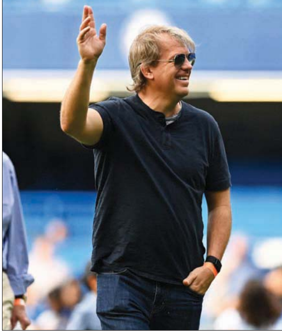
الأميركي تود بوهلي مالك تشيلسي الجديد

خفف راتبه من أجل مغادرة «ستامفورد بريدج». وعاد السلجكيكي إلى تشيلسي الصيف الماضي في صفقة قياسية للنادي اللندني بلغت 97,5 مليون جنيه إسترليني (115 مليون يورو)، مؤكداً أن الصفقة كانت بمثابة عودة عاطفية إلى بيته بعد أن لعب للنادي اللندني في الفترة بين 2011 و2014. ولكن بعد تسجيله أربعة أهداف في أول أربع مباريات له، صام الهدف البالغ من العمر 29 عاماً، عن التعديف لفترة طويلة. وأنهى لوكاكو الموسم في صدارة أهداف تشيلسي برصيد 15 هدفاً في مختلف المسابقات، لكن لاعب مانشستر يونايتد وإيفرتون