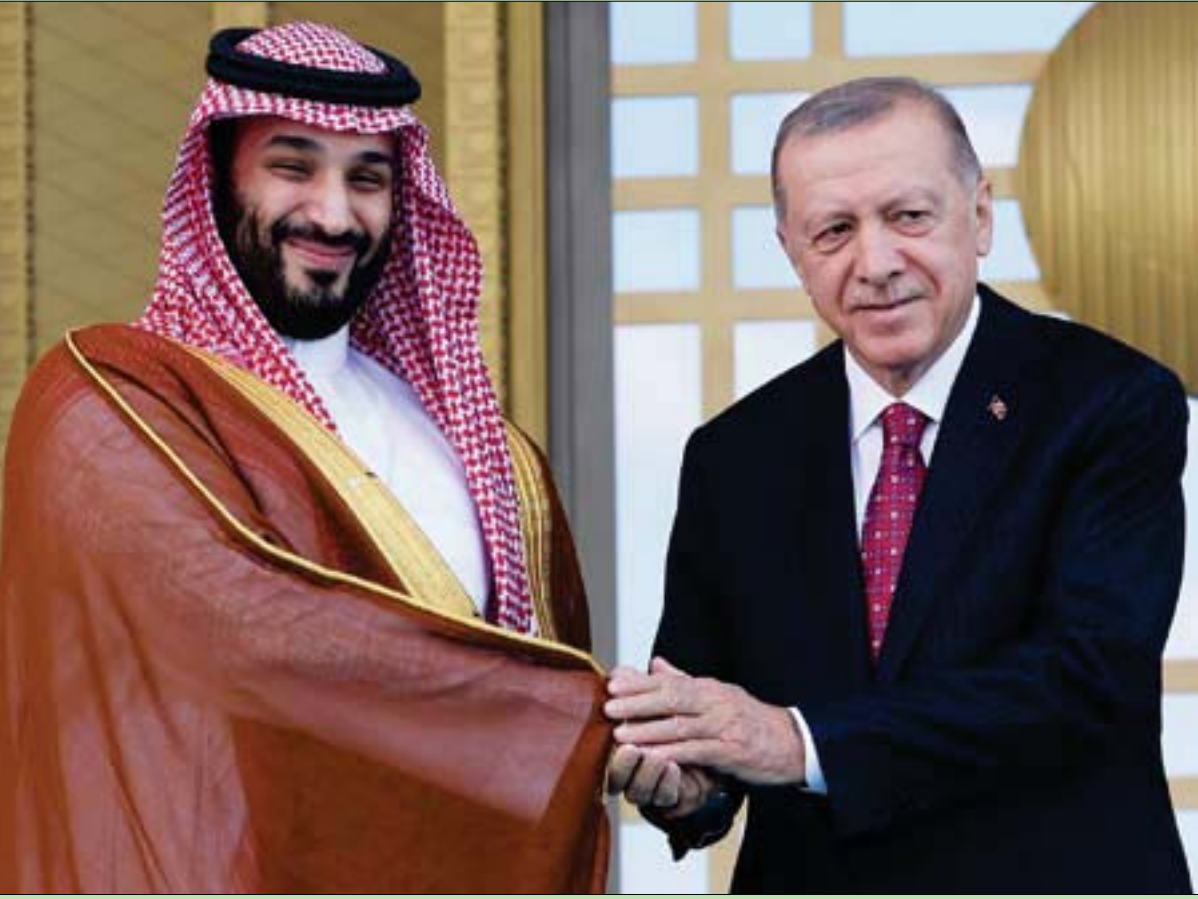
أنقرة، سعيد عبد الرازق

اختتم ولي العهد السعودي الأمير محمد بن سلمان زيارة إلى تركيا أمس، منهيًا بذلك جولته الخارجية التي شملت مصر والأردن، وأجرى خلالها محادثات مع قادة تلك الدول، تناولت تطوير العلاقات وتعزيز الأمن والاستقرار في المنطقة، إضافة إلى بحث ملفات استراتجية واقتصادية وتنموية. وجاءت زيارة ولي العهد إلى تركيا أمس في سياق توطيد العلاقات ومد جسور التعاون بين البلدين. وأجرى الأمير محمد بن سلمان مباحثات رسمية مع الرئيس التركي رجب طيب أردوغان، نقل له خلالها تحيات وتقدير خادم الحرمين الشريفين الملك سلمان بن عبد العزيز، فيما حفلته الرئيس التركي تحياته وتقديره لخادم الحرمين الشريفين. وأفاد بيان مشترك في ختام الزيارة، بأن الجانبين أكدا عزمهما على تعزيز التعاون في المجالات السياسية والاقتصادية والعسكرية والأمنية والثقافية، وتبادلا وجهات النظر حيال أبرز المستجدات الإقليمية والدولية. وناقش الجانبان سبل تطوير وتنوع التجارة البينية، وتسهيل التبادل التجاري، وتذليل أي صعوبات، وتخفيف التواصل بين القطاعين العام والخاص في البلدين لبحث الفرص الاستثمارية. واتفق البلدان على تفعيل أعمال مجلس التنسيق السعودي - التركي، وأعبأ عن تطلعهما للتعاون في مجالات الطاقة، وسلاسل الإمداد المرتبطة بها. وفي مجال البيئة، رحب تركيا بإطلاق المملكة مبادرتي «السعودية الخضراء» و«الشرق الأوسط الأخضر» وأعبرت عن دعمها لجهود المملكة في مجال التغير المناخي. (تفاصيل ص2)