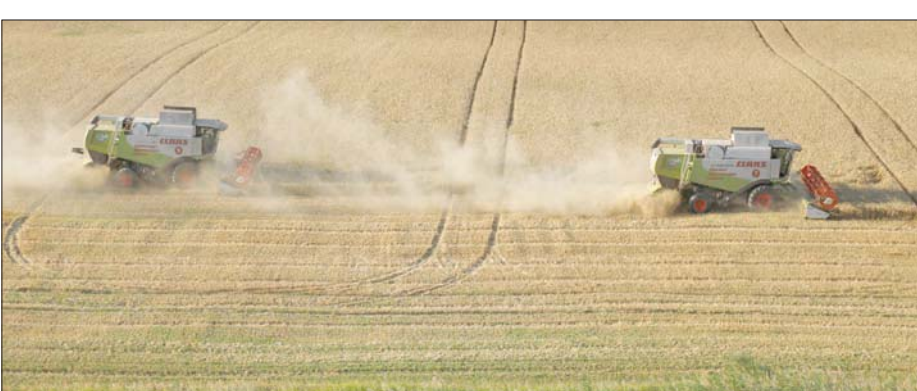
أوكرانيا من أهم منتجي السلع الزراعية في العالم، وروسيا ثاني أكبر مصدر للقمح

أنها «أول سفينة أجنبية تغادر ميناء ماريوبول» الذي استولى عليه الروس في مايو (أيار) الماضي. وقالت إنقرة إن اجتماعاً رباعياً يضم ممثلين عن الأمم المتحدة وروسيا وأوكرانيا سيعقد في «الأسابيع المقبلة» في تركيا بهدف تنظيم نقل الحبوب في البحر الأسود. وكان الرئيس الأوكراني فولوديمير زيلينسكي قد قال أول من أمس (الاثنين)، إن «مفاوضات صعبة» تجري في الموانئ الأوكرانية التي لا يمكن تصدير ملايين الأطنان من الحبوب منها بسبب الحصار الذي يفرضه الأسطول الروسي في البحر الأسود.