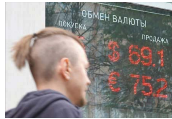
يواصل الروبل الروسي أداءه المتفوق ليصبح الأفضل عالمياً

تغرت خارطة أداء العملات العالمية خلال الأسابيع الأخيرة، ليستبد الروبل الروسي عملات العالم من حيث الأداء، فيما تراجع قوة الين بعنف في ظل الضغوط الاقتصادية. وقفز السرويل لأعلى مستوياته في سبعة أعوام أمام الدولار واليورو في بورصة موسكو يوم الثلاثاء، مدعوماً بقبول على تحركات رؤوس الأموال ومدفوعات ضرائب في نهاية الشهر.