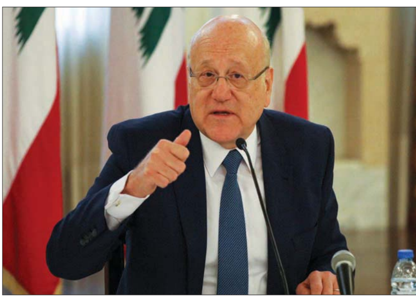
الرئيس نجيب ميقاتي في مؤتمر صحفي في ديسمبر الماضي

إنجاز يُذكر، طالما أن القرار يعود إلى رئيس «التيار الوطني الحر» النائب جبران باسيل الذي بصر على أن تأتي التشكيلية الوزارية على قياسية لعله يتحتمن من تعويم نفسه سياسياً. ويرى هؤلاء أن لا غبار على المواصفات التي يتمتع بها سلام، لكنه ليس مضطراً لأن يحرق أوراقه بدلاً من أن يترتب لبعض الوقت لقطع الفترة المتبقية من ولاية عون الذي لن يقدم التسهيلات على طبع من قضاة لمقاتي ما لم يسلّم بشروطه برغم أنه يدرك سلفاً أن الرئيس المكلف لن يرضخ لابتزاز باسيل. فعودة ميقاتي إلى رئاسة الحكومة تأتي بخلاف إرادة عون بالإنابة عن باسيل، بعدما أخفق في تسويق شخصية بديلة لمقاتي؛ خصوصاً أن الرئيس المكلف هو من يتولى إجراء مشاورات