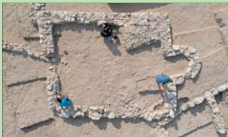
صورة من الجو للمسجد الأثري المكتشف في النقب