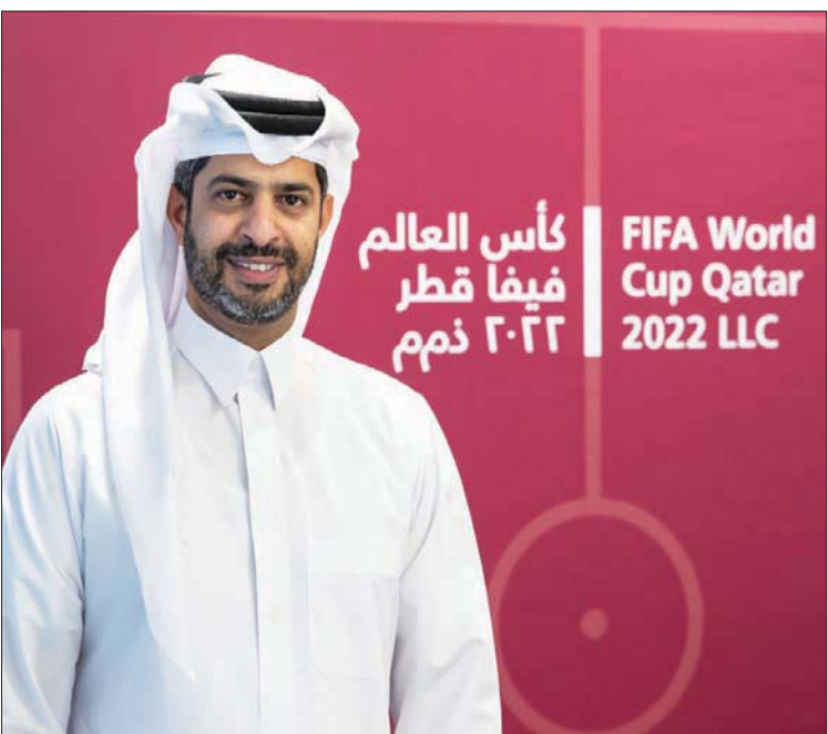
ناصر الخاطر الرئيس التنفيذي لكأس العالم 2022 (موقع لجنة المشاريع والإرث القطرية)

إلى 3200، على أن يصل إلى أكثر من 12000 بحلول موعد الحدث الكروي. ويتم تعين هؤلاء الأشخاص من قبل اللجنة المنظمة لكأس العالم، ولكن يتم تدريبهم من قبل المجموعة الفندقية. وقال بازين إنه من أجل «إدارة جميع الخدمات اللوجيستية، لا يمكننا الاعتماد فقط على السكان المحليين، ومن هنا تأتي حقيقة أنه يتعين علينا جلب الكثير من الأشخاص» من أفريقيا وإندونيسيا والفلبين ومن أميركا الجنوبية وأوروبا الشرقية.