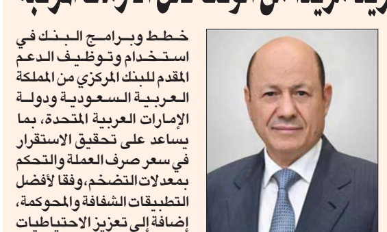
الدكتور رشاد العلمي (سبأ)

عدن، علي ربيع الرياض، عبد الهادي حيتور على خلفية الاحتجاجات التي شهدتها مدينة عدن اليمنية لجهة ضعف إمدادات الكهرباء وارتفاع أسعار الوقود، واستمرار انخفاض سعر العملة (الريال) طلب رئيس مجلس القيادة الرئاسي في اليمن رشاد العلمي من مواطنيه (الأربعاء) مزيداً من الوقت لحل ما وصفه بـ«الأزمات المركبة». وتصريحات العلمي التي جاءت في شكل تغريدات على «تويتر» تسعى كما يبدو إلى تهدئة أحقان الشارع اليمني في المناطق المحررة بسبب تدهور الأوضاع الاقتصادية ونقص الخدمات، على أمل أن تسفر المساعي الرئاسية الإيجابية إلى تخفيف حدة الأزمة في الأسابيع المقبلة اعتماداً على الدعم الخليجي المرتقب الذي تنتظره الحكومة على هيئة مساعدات وودائع لمصلحة البنك المركزي. وقال العلمي: «لقد تابعت بالأم شديد واهتمام بالغ الاحتجاجات الشعبية في مدينة عدن الحبيبة وأنفهم أسبابها ومبرراتها، وأعدكم أنني وأعضاء مجلس القيادة الرئاسي سنبدل كل جهد لاتخاذ كل ما يمكن عمله». ووعد بأنه سيبدل «المزيد من الجهود لأجل الحصول على مساعدات استثنائية عاجلة من الأشقاء للتخفيف من هذه الأزمة الخانقة في قطاع الكهرباء، والتي تحتاج إلى تدخلات سريعة بعيداً عن معالجة كيفية التخلص من الخطر حول الناقلة، وسيتم تحديد ذكراً، لاحقاً، لكننا إذ لم نحلرنا بسرعة؛ فإن كل هذا النقط يتجه إلى البحر الأحمر، وسيؤدي إلى انتكاسة التجارة العالمية، وصيد الأسمك والسياحة، ولن يكون هناك نقاش حول ما سيحدث للنقط. لذا، نحن في حاجة إلى العمل الآن لمعالجة هذا الوضع العاجل».