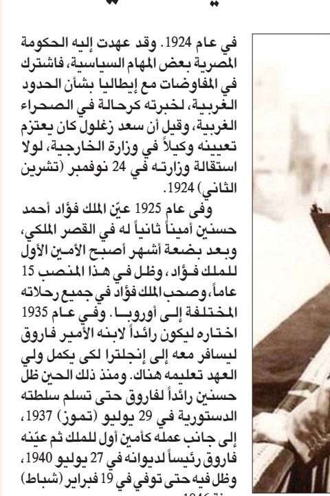
القاهرة، حمدي عابدين

يتناول كتاب «أحمد حسنين ودوره في السياسة المصرية من 1940 إلى 1946»، الصادر حديثاً عن دار الثقافة الجديدة، تأليف الباحثة الدكتور ماجدة محمد حمود، استعراضاً شاملاً لشخصية مهمة كان لها دور بارز في مصر الملكية منذ انضمامه إلى العمل بالقصر في عهد الملك فؤاد عام 1925 حتى وفاته في حادث سير بعد 21 عاماً في عهد الملك فاروق.