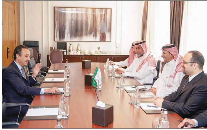
جانب من لقاء وزير الصناعة والثروة المعدنية مع سفير المملكة المتحدة (الشرق الأوسط)

والفرص الاستثمارية والتأكد على استمرار التعاون، حيث يبلغ إجمالي صادرات المملكة غير النفطية للمملكة المتحدة 1,53 مليار ريال (400 مليون دولار)، فيما وصل إجمالي وارداتها غير النفطية للمملكة المتحدة 10,50 مليارات ريال (2,8 مليار دولار). وأكد اللقاء أهمية رفع مستوى التعاون في العلاقات الثنائية في القطاعين وتعزيز قنوات التواصل بما يسهم في جذب الاستثمارات النوعية ويتواءم مع مستهدفات رؤية المملكة 2030 الرامية إلى تنويع القاعدة الاقتصادية. ويبلغ حجم الاستثمارات الحالية في قطاع الصناعة السعودي 400 مليار دولار، بما يزيد على 10 آلاف مصنع، وجذبت المملكة خلال العام الماضي استثمارات جديدة تجاوزت 20 مليار دولار، كما