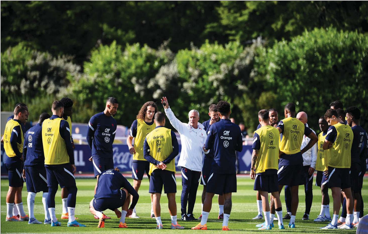
ديشامب ما زال مؤمناً بجموعته القديمة قبل خوض فرنسا حملة الدفاع عن كأس العالم

وعلاوة على ذلك، تحوم الشكوك حول مستقبل ديشامب. فبعد عقد كامل من توليه المسؤولية، ينتهي عقده في نهاية العام، في الوقت الذي ينظر فيه زين الدين زيدان الفرصة المناسبة لتولي المنصب. لن يكون تغير المدير الفني بعد كأس العالم بالضرورة إشارة إلى تغيير كبير في النهج التكتيكي - لا يزال هناك تركيز على وجود مدير فني يمتلك شخصية قوية ويحظى بحب واحترام اللاعبين بسبب تاريخه الكبير، وليس مديراً فنياً قوياً من الناحية التكتيكية في المقام الأول - لكن من المؤكد أن هذا التغيير سيكون بمثابة بداية عصر جديد يتم فيه التخلص التدريجي من الحرس القديم لصالح جيل جديد من اللاعبين الشباب. وهذا هو ما سيحدث، ما لم يوافق زيدان على تولي القيادة الفنية لباريس سان جيرمان أولاً. وفي هذه الحالة، من المقترض أن يعتمد التمديد على الحرس القديم الذي استقطعه كبير حاجة إلى إيجاد طريقة تمكن بنزيمه ومبابي من تقديم أفضل ما لديهما داخل الملعب، مع تطوير أداء خط الدفاع الذي يعاني بشكل واضح. وعلى