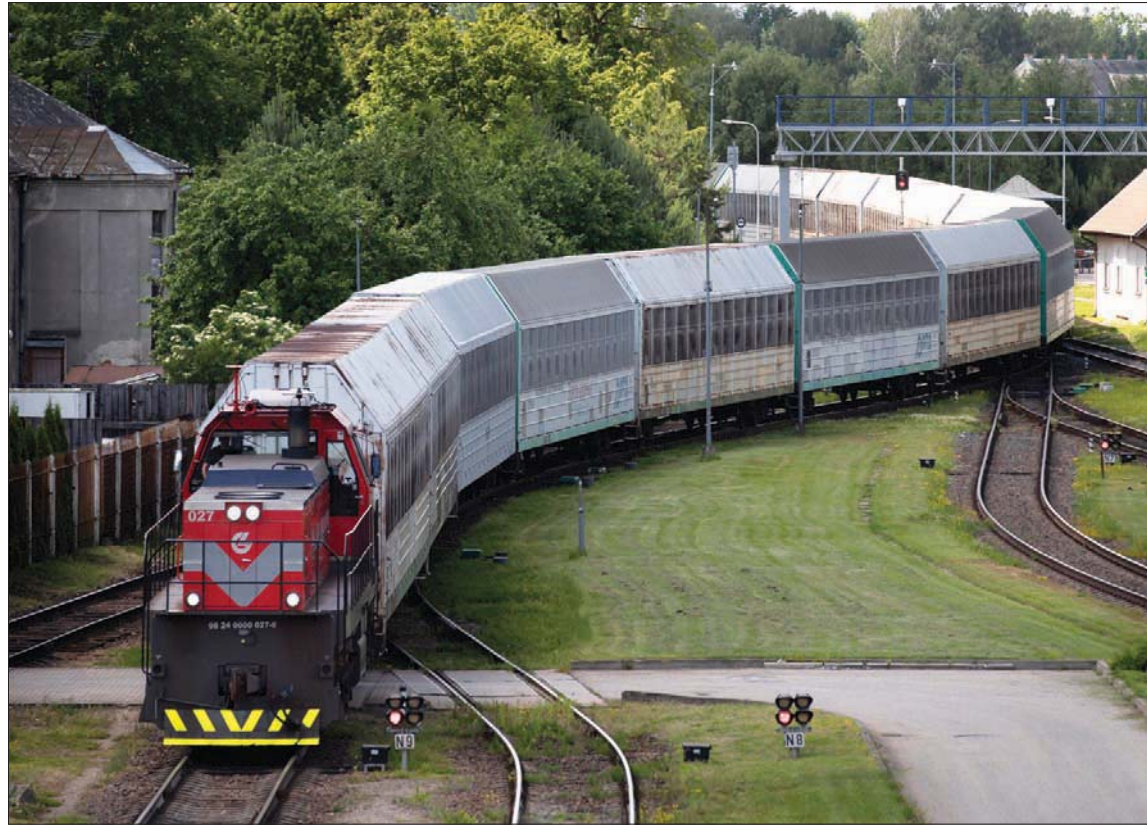
ليتوانيا تغلق طرقها أمام حركة نقل البضائع الروسية إلى كاليينغراد بعد يوم على إغلاقها خطوط سكك الحديد (أب)

موسكو، راند جبر أعلن المناطق الرئاسي الروسي دييمري بيسكوف، أن بلاده تعمل على إجراءات للرد على القيود التي فرضتها ليتوانيا على مرور البضائع إلى إقليم كاليينغراد الروسي. وحمل الإعلان الروسي إشارة إلى أن موسكو لن تتنازل مع التطور الذي يهدد بحصار أراض روسية، وفقاً لتعليق مصدر دبلوماسي، أمس، أشار إلى أن القرار الليتواني «كما كان متوقفاً، لقي تأييداً واسعاً في واشنطن وعواصم أوروبية». وكانت ليتوانيا قد أعلنت تطبيق حظر على عبور سلع خاضعة لعقوبات من الاتحاد الأوروبي، إلى منطقة كاليينغراد الروسية الواقعة على بحر البلطيق. وبعد مرور يوم على الإعلان عن إغلاق خطوط سكك حديدية أمام البضائع الروسية التي تعبر الأراضي الليتوانية إلى الإقليم المعزول، عززت خطواتها بإعلان إغلاق الطرق البرية أمام حركة نقل البضائع أيضاً. ونددت موسكو بال تصرف «العدائي» ولوحث بد «صارم» على القرار الليتواني، وقال بيسكوف أمس، إنه يجري النظر في إجراءات مختلفة للرد على السلوك «غير الودي» من جانب الاتحاد الأوروبي. لكن بيسكوف رفض الرد بشكل مباشر على سؤال الصحافيين عن إمكانية أن يكون هناك رد عسكري من