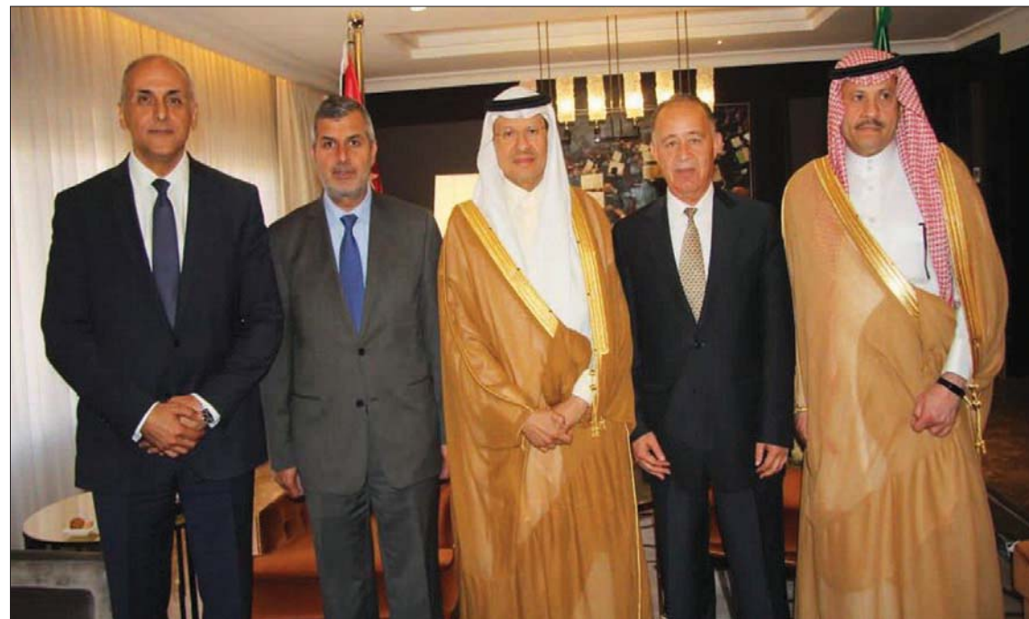
وزير الطاقة السعودي مع وزراء الطاقة والمياه والبيئة في الأردن (واس)

وإكسون موبيل العملاقان هذا الأسبوع إلى أن التوقعات لا تزال تشير إلى أن الإمدادات العالمية يتوقع أن تتخلف عن