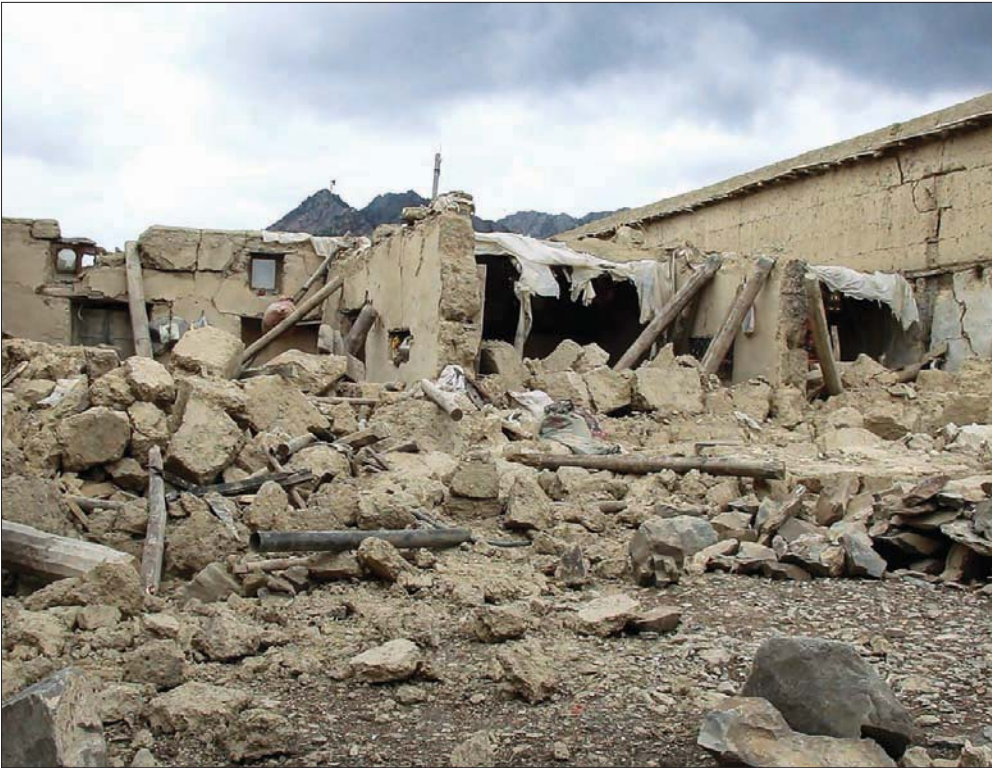
دمار سببه الزلزال في ولاية بكتيكا