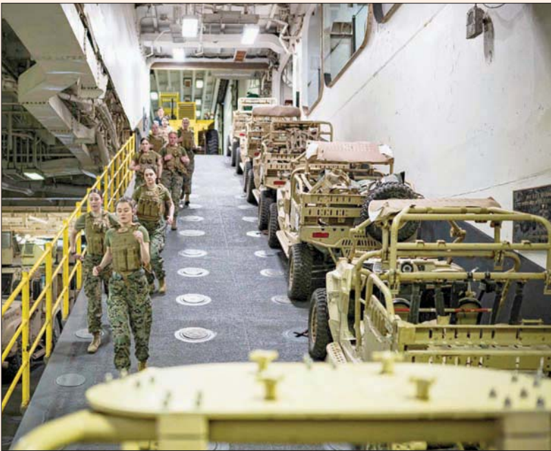
قوات المارينز الأميركية تشارك في مناورات «بالتوبس 22»، للناو

في فيلنيوس مع قادة دول البلطيق: «نحن مستعدون لتعزيز التزامنا وتطويره إلى لواء قتالي قوي يمكنه بشكل مشترك تنظيم الردع والدفاع عن ليتوانيا» في حال حصول عدوان. وأضاف: «لهم أيضاً رداً على الهجوم الروسي، والقيام بكل شيء حتى لا تتمكن روسيا من الانتصار في هذه الحرب». وقال رئيس ليتوانيا جيتاناس نوسيدا: «نعتقد أن لا أحد لديه أو هام بشأن روسيا اليوم. علينا أن نفهم أن التهديد الروسي لا يكون هناك حوار ولا تعاون ولا تهديد مع هذه الأمة التي ما زالت تسعى لتحقيق طموحاتها الإمبريالية». وقالت رئيسة الوزراء الإسفونيه كايا كالاس: «يجب أن نجعل المعتدي يدرك أن حلف شمال الأطلسي ليس لديه الإرادة فحسب بل القدرة على الدفاع عن كل شبر من أراضيه». في السنوات الأخيرة، عزز الحلفاء الوجود المتقدم للحلف الأطلسي على جانبه الشرقي. ومع بداية الحرب قرر الحلفاء إنشاء أربع مجموعات تكتيكية جديدة في بلغاريا والمجر ورومانيا وسلوفاكيا. ومن المقرر أن تُعقد قمة للناو في 29 و30 يونيو في مدريد.