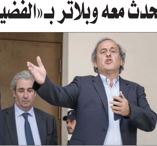
بلاتيني لحظة خروجه من المحكمة

بلاتيني يصف ما يحدث معه وبلاتر بـ«الفضيحة»