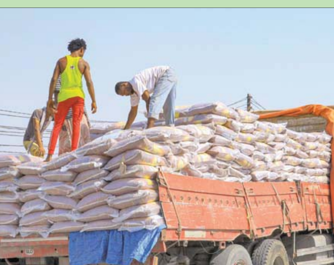
جانب من عملية تحميل الطحين في ميناء الحديدة

وتقول الدراسة إن الحرب أثرت في قدرة النقل الجوي على العمل بشكل طبيعي، وأصبحت مطارات صنعاء وتعز وعدن والحديدة خارج الخدمة أو تعمل بقدرة منخفضة جداً، وفي حين سيطرت الميليشيات الحوثية على مطار صنعاء وحولته إلى ثكنة عسكرية ومنصة