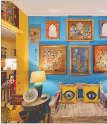
زخم فني وحضاري

حيوانات بعضها مالوف وبعضها الأسود المنقرض، فألى جانب القبلة والأسود والأسماك تعطر على الخيران المجدحة ربما تائراً بالثور الأشوري، كما تتنقى مع الطيور والحيوانات ذات الأجسام المركبة التي ترتبط عبر علاقات تشكيلية أسطورية لا تخلو من النزعة الدرامية، كما تطل علينا في أعماله جمال نسوة بغداد والبصرة والموصل وخيرات الأنهار والأرض اليابسة معاً.