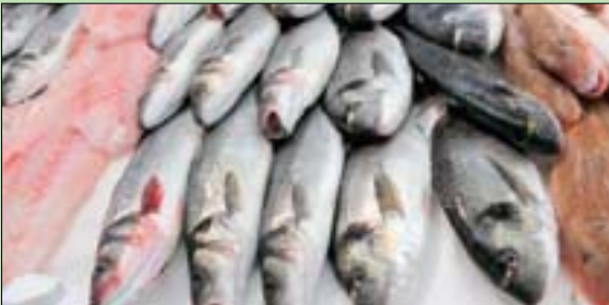
مخاوف من آثار الملوثات في السمك

وقال القائمون على الدراسة: «نتوقع أن النتائج التي توصلنا إليها يمكن أن تعزى إلى الملوثات الموجودة في الأسماك، مثل ثنائي الفينيل متعدد الكلور والديوكسينات والزرنيخ والربثين». في المقابل، قال خبراء آخرون إن الأسماك غداء صحي مهم ولا داعي للوقوف عن تناولها. من جهته، قال دوان ميلور، كبير المحاضرين في كلية الطب في أستون: «يشير المؤلفون إلى أنه يمكن أن يكون هناك رابط بين الملوثات في الأسماك، ما قد يزيد من خطر الإصابة بالسرطان، ولكن من المحتمل أن يؤثر هذا من خطر الإصابة بما هو أكثر من مجرد سرطانات الجلد».