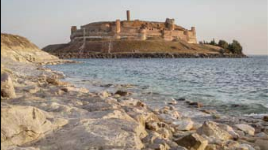
قلعة جعبر الأثرية في شمال سوريا

أطعمة وفواكه، ويلهو أطفال قريبا، بينما تصدح أصوات الموسيقى في الأرجاء.