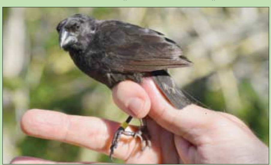
تتبع أنماط الحركة اليومية لهذا العصفور إلكترونياً (إيكولوجي آند إيفولوشن)

وتركت كل العصافير التي وضعت عليها علامة مناطق تكاثرها بعد غروب الشمس، وتحركت أربعة أضعاف المسافة التي تقطعها عادة في النهار، وكانت الوجهة الغامضة، هي بستان خصب من أشجار التفاح يقع بجوار البحر حيث يتجمع ما يقرب من ألف طائر ليلاً للراحة.