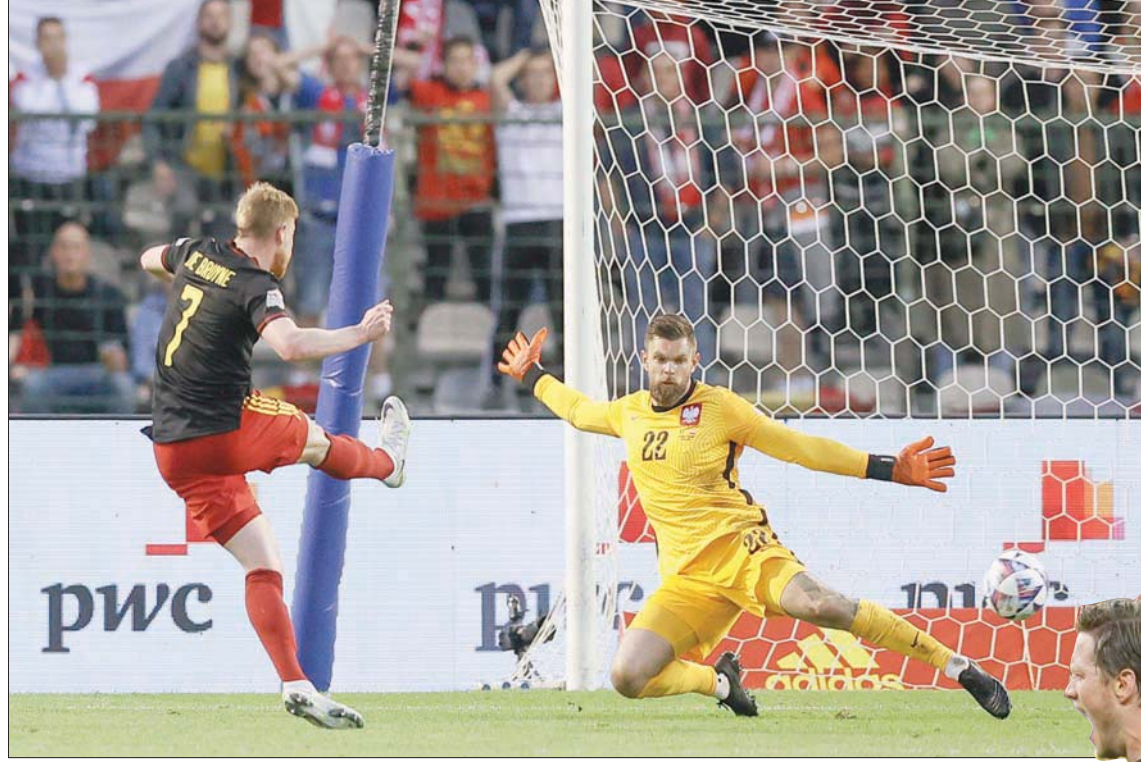
دي بروين يسجل ثاني أهداف بلجيكا من سداسية الانتصار على بولندا

براسية رائعة أسكن بها الكرة الشباك خاطفاً النقاط الثلاث لمنتخب هولندا. وقال فان غال عقب المباراة: «لقد كانت هجمات مرتدة رائعة لكننا كنا متذبذبين في الشوط الأول وفقدنا الكرة كثيراً، عدم التركيز جعلنا نفقد الكرة عند شن هجمات. لكنني سناظر أقول إن لدينا تشكيلة رائعة». وخسر منتخب ويلز الآن مباراته في الموسم الجديد بدوري الأمم بعد الهزيمة أمام بولندا قبل أسبوع، وشاهد أيضاً سجله الذي شمل 19 مباراة دون هزيمة على أرضه وهو ينتهي بشكل حزين. في المقابل أدى هذا الانتصار لتعزيز سجل هولندا القياسي بالفوز على ويلز في كافة المباريات التسع التي جمعت بينهما بنسبة نجاح 100 في المائة ليتصدر الفريق مجموعته بدوري الأمم. وفي مباراة ثانية في المجموعة نفسها، عوض المنتخب البلجيكي خسارته الافتتاحية أمام هولندا، بدت شباك نظيره البولندي بسنة أهداف مقابل هدف واحد. وافتح بولندا التسجيل عن طريق نجم بايرن ميونيخ الألماني روبرت ليفاندوفسكي في الدقيقة 28، قبل أن يقلب الشبابتين الحمراء» على مدى الشوطين بخمسة تناوب على تسجيلها لاعب بوروسيا دورتموند أكسل فيتسل في