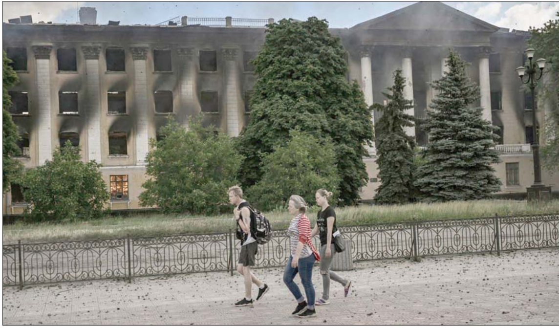
مبنى جامعي يحترق بعد تعرضه لصفوف روسي في ليسييتشانسك الواقعة على الضفة الغربية لنهر سيفيرسكي دونيتس في شرق أوكرانيا (أ.ف.ب)

كييف - ليل (فرنسا) «الشرق الأوسط»، كييف - ليل (فرنسا) «الشرق الأوسط»، أكثر من مائة جندي أوكراني يقتلون و500 يصابون كل يوم في المعارك مع الجيش الروسي، حسب تقديرات وزير الدفاع الأوكراني أوليكسي ريزنيكوف، الذي قدم أمس (الخميس) هذه الأعداد مع تواصل معركة دونباس «المصيرية»، خصوصاً في مدينتي سيفيرودونيتسك وليسيشانسك، التي اعتبرها الرئيس الأوكراني فولوديمير زيلينسكي صعبة وحشية. وأشار زيلينسكي، إلى أن معركة السيطرة على مدينة سيفيرودونيتسك ستحدد مصير منطقة دونباس، بينما تنتشر القوات الروسية الدمار في المدينة في هجوم يهدف للسيطرة على شرق أوكرانيا. وقال زيلينسكي في تسجيل فيديو نشر مساء الأربعاء «دفاع عن مواقعنا وبلحوق خسائر فادحة بالعدو»، مؤكداً أنها «معركة شاقّة جداً وصعبة جداً، وقد تكون واحدة من أصعب المعارك في هذه الحرب». وأضاف، أن «سيفيرودونيتسك لا تزال محور المواجهة في دونباس... إنها تعتبر إلى حد بعيد المكان الذي يتحدد فيه مصير دونباس الآن». وقال متحدث عسكري بريطاني، أمس، إن القوات الروسية كثفت جهودها للتقدم إلى الجنوب من بلدة إيزيوم بشرق أوكرانيا، وذكرت وزارة الدفاع البريطانية، أن «التقدم الروسي على محور إيزيوم ظل متوقفاً منذ أبريل (نيسان)، بعد أن استغلت القوات الأوكرانية تضاريس المنطقة بشكل جيد لإبطاء تقدم