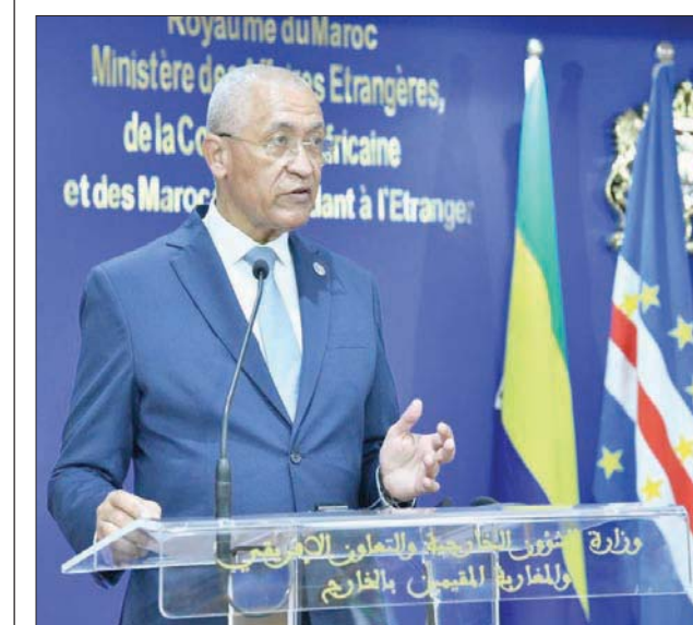
الرباط، «الشرق الأوسط»

وزير خارجية الرأس الأخضر في مؤتمر صحفي أول من أمس (الشرق الأوسط) الذي انعقد بمراكش في 25 مارس (آذار) 2019.