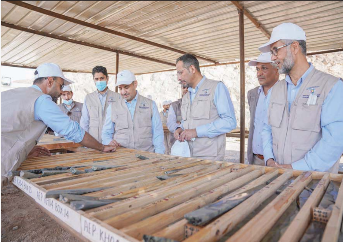
زيارة لوزير الصناعة والثروة المعدنية إلى موقع الخنيفة للتعدين في السعودية (الشرق الأوسط)

ووفقاً لنتائج النشرة، ارتفع الرقم القياسي العام للإنتاج الصناعي لأبريل الماضي قياساً بمارس (آذار) من العام نفسه بنسبة 0,5 في المائة، متناًراً بالارتفاع في نشاط التعدين