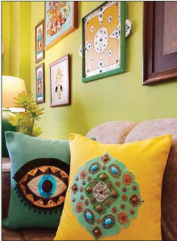
فولكلور شعبي وتطريز يدوي

ويواصل: «أرض الكنانة» تمثل نموذجاً فريداً لدعم كل موهبة حقيقية توجد على أرضها، ويزيد من الأمر بالنسبة لي أن ما بين العراق ومصر الكثير من المشتركات، من حيث الحضارة والتاريخ وتفاصيل الطبيعة ومراكز الثقافة ومنازل العلوم، ما يسهم في اندماجها وانصهارها هنا سريعاً».