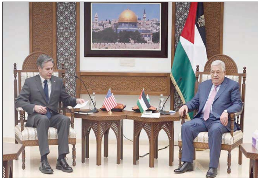
عباس خلال استقباله وزير الخارجية الأميركي أنتوني بلينكن في مارس الماضي

الله وبدء أبو مازن مشاورات مع مستشاريه وأعضاء في القيادة السياسية من أجل تفعيل قرارات المجلس المركزي الفلسطيني، التي تتضمن من بين توصيات أخرى، قطع العلاقات مع إسرائيل وتجميد الاعتراف بها. وأراد بلينكن احتواء الغضب الفلسطيني الذي لمسه في نبرة عباس، الذي قال له إنه لا يمكن له السكوت عن الوضع الحالي ولا يمكن عمله. ويفكر عباس بتبني قرارات المجلس المركزي، بما يشمل تجميد الاعتراف بإسرائيل بغض النظر عن تداعيات ذلك. وقال بلينكن في أثناء المحادثة لعباس، إنه يدرس تعيين هادي عمرو ممثلاً خاصاً لشؤون الفلسطينيين، حتى يكون بمثابة قنصل عام أميركي يجلس في واشنطن. لكن عباس لم يكن متحمساً للفكرة، وذكر بلينكن بأنه تعهد بنفسه قبل عام بأن تعيد واشنطن افتتاح القنصلية الأميركية في القدس. وحتى وصول بايدن، تدرس إدارته تجهيز حزمة خطوات لصالح الفلسطينيين، إذ يرغب في إحياء الضفة الغربية، ولا يريد أن تنتهي زيارة الرئيس الأميركي بفشل ما يعني تعقيد الموقف.