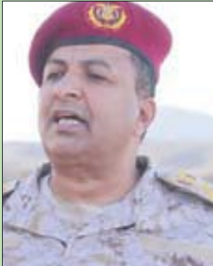
العميد ركن عبده مجلي

وشدد على أن «الجيش الوطني ملتزم بالهدنة والمبادرة الأممية وينفذ تعليمات القيادة العسكرية بانضباطية عالية».