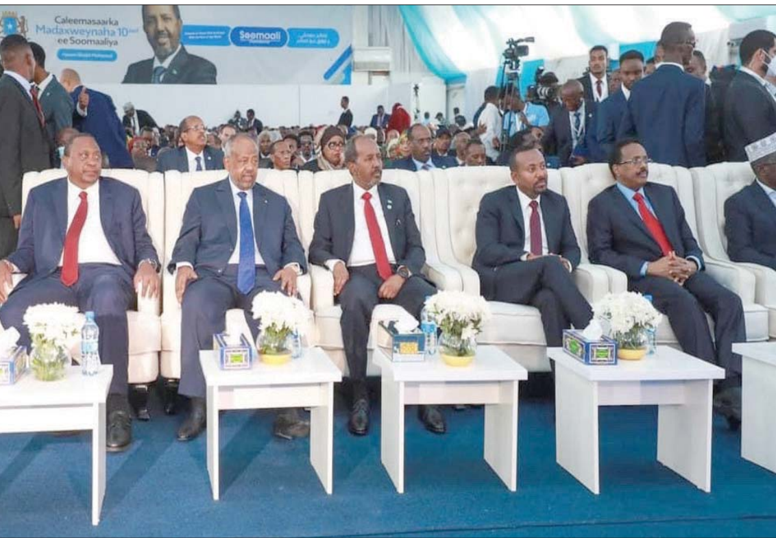
صورة ورعته وكالة الأنباء الصومالية الرسمية لحفل تنصيب الرئيس الجديد

كيني يبريد الرفاه للصومال، وأكد أنهم سيكافحون من أجل التنمية الاقتصادية للمنطقة والبلد. وجددت تركيا على لسان وزير زراعتها وحيد كيريشتي، خلال مسيرته في حفل التنصيب، تعهد بلاده بدعم الصومال للخروج من أزمته الإنسانية والسياسية والأمنية، للخروج من أزمته الراهنة. وحصل الرئيس الصومالي حسن شيخ محمود، الذي شغل المقعد الرئاسي في الانتخابات