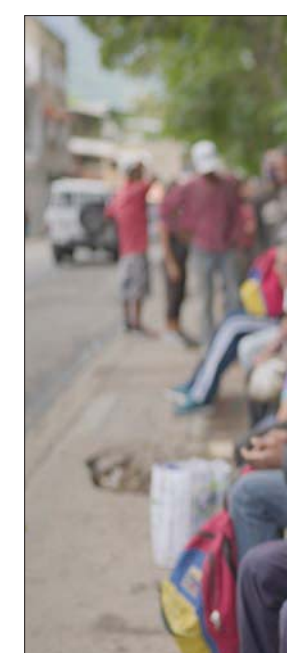
العديد من البلدان الفقيرة تتكبد تكلفة أكبر للغذاء... ولكنها تحصل على كميات أقل (أب)

ويبحث هذا التقرير كذلك في الاتجاهات في أسواق العقود الآجلة وتكاليف شحن السلع الغذائية. وتضمن النسخة الجديدة من التقرير أيضاً فصلين خاصين يتناولان دور ارتفاع أسعار المدخلات الزراعية، مثل الوقود والأسمدة، والمخاطر التي تطرحها الحرب في أوكرانيا على الأسواق العالمية للسلع الغذائية. نتائج وتوقعات مستقبلية ووفقاً للنتائج، فمن المتوقع أن ينخفض الإنتاج العالمي للحبوب الرئيسية في