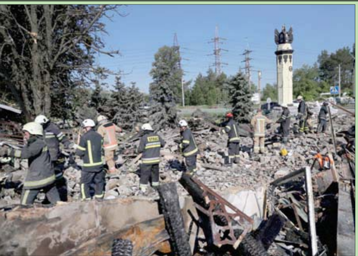
عناصر الدفاع المدني يبحثون عن مصابين وسط الركام بعد غارة عسكرية في خاركيف أمس (رويترز)