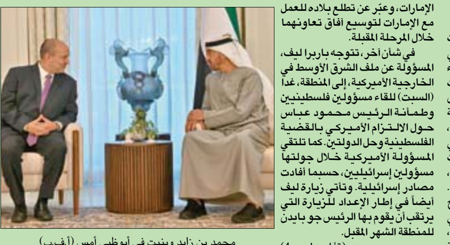
محمد بن زايد وبنيت في أبوظبي أمس