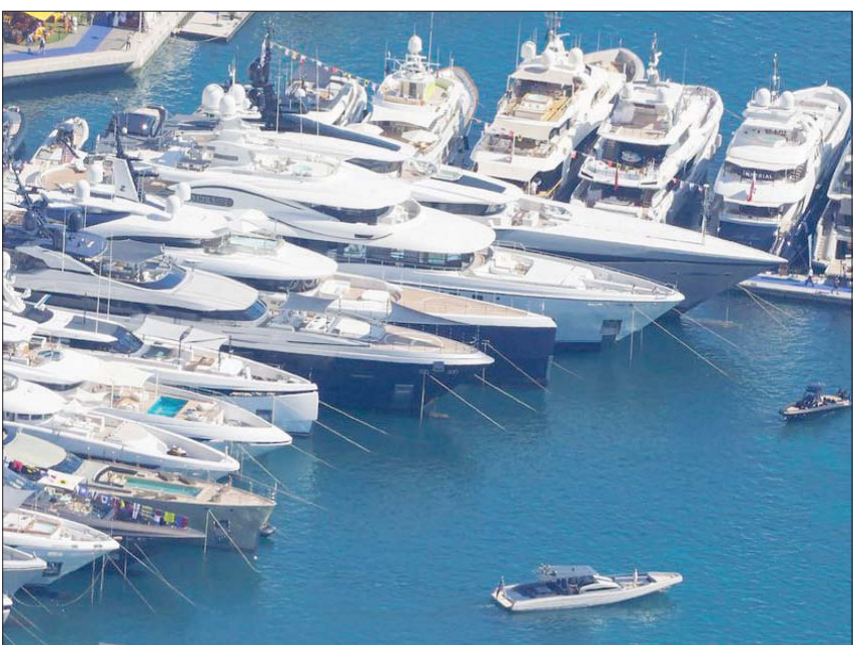
يضم العالم نحو 69 ألف شخص فائق الثراء يمتلكون 15 بالمائة من إجمالي الأصول المالية

الثراء، تلتها الصين وتضم البلدان للآزمة الأينية المتضخلة في ارتفاع تكلفة المعيشة، مشيرة إلى أهمية الاستثمار طويل المدى. وفي شأن منفصل، أظهر تقرير اقتصادي نُشر أمس (الخميس)، ارتفاع إجمالي الثروات في العالم خلال العام الماضي بنسبة 10,3% إلى 473 تريليون دولار، وبخاصة بفضل ازدهار أسواق الأسهم.