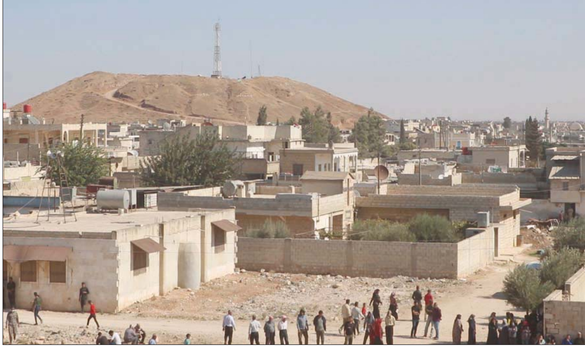
سكان في تل رفعت (شمال سوريا) قلقون من الهجوم التركي المحتمل