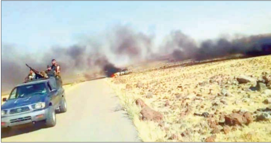
صورة للاشتباكات في بلدة خازمة بريف السويداء نشرها موقع «شبكة السويداء» 24

ولم يصدر من قاعدة التنف الأميركية أو جيش مغاوير الثورة الذي كانت تتعاون معهم قوة مكافحة الإرهاب أي تعليق على الحادثة، رغم إصدار لقوات سابقاً على القول بوجود تعاون بينها وبين القاعدة الأميركية. يذكر أن قوات من فرع الأمن العسكري في السويداء مع قوات محلية تابعة لها طوقت معقل قوة مكافحة الإرهاب في السويداء في بلدة خازمة صباح يوم الأربعاء، وأغلقت الطرق المؤدية للبلدة، وشنت هجوماً على مجموعة قوة مكافحة الإرهاب واستمر التوتر والاشتباكات حتى مساء الأربعاء، وانتهى الأمر بعد تثبيت نقطة عسكرية للنظام شرق البلدة وخروج عناصر القوة باتجاه البادية ومقتل مترجمها.