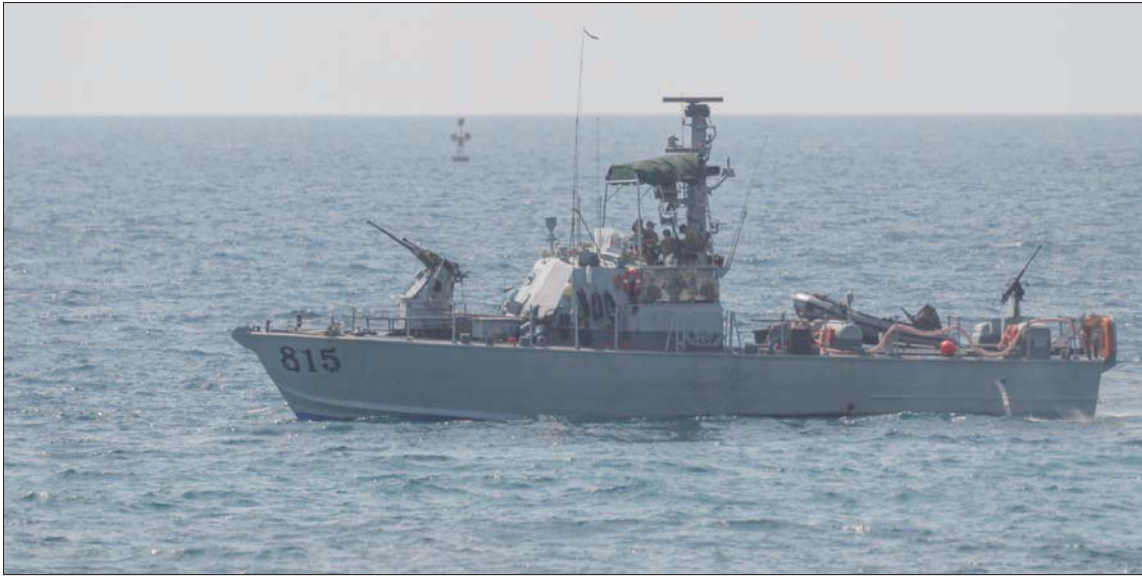
زورق تابع لسلاح البحرية الإسرائيلية قرب الشواطئ اللبنانية

وقالت المصادر: «الأولوية اليوم للمباشرة بالتنقيب واستخراج الطاقة، كما تفعل إسرائيل في حقول أخرى بعيدة عن الحدود اللبنانية، بالتزامن مع التمسك بالحقوق اللبنانية وعدم التفريط بها ضمن البتة اتفاق الإطار الملغ عنها منذ أكتوبر (تشرين الأول) 2020».