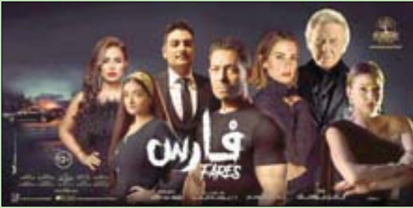
أقيش فيلم فارس

ويحسب النقاد السينمائي خالد محمود فإن عدم تحقيق الفيلم لإيرادات أكثر من سبب، أولها أنه يعرض إلى جوار فيلم أحمد حلمي، ورغم أنه ليس أفلام حلمي، لكن الجمهور يفضل البطل الذي يعرفه ويعتاد مشاهدة أفلامه، والذي يضحك بفيلم كوميدي. ويضيف محمود لـ «الشرق الأوسط»: «اليس من الضروري أن يحقق الممثل المتألق تلفزيونياً نفس الصدى في السينما، فالسينما تختلف عن الدراما التلفزيونية كثيراً، ويحكمها حساب».