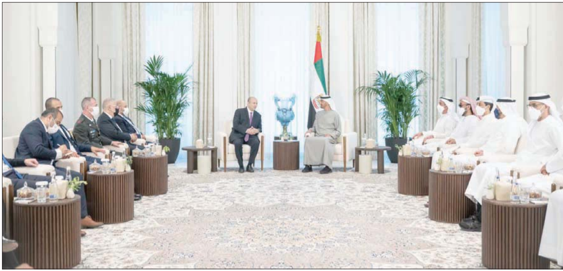
الشيخ محمد بن زايد ونفتالي بنيت خلال اللقاء أمس في أبو ظبي بحضور وفد رفيع المستوى من البلدين

زيد وشعب الإمارات، في وفاة الشيخ خليفة بن زايد آل نهيان، مشيداً بدور الفقيد في مد جسور التعاون والتواصل والسلام مع دول العالم وفقاً لما نقلته وكالة أنباء الإمارات (وام). كما هنا رئيس وزراء إسرائيل الشيخ محمد بن زايد آل نهيان على توليه رئاسة دولة الإمارات، متمنياً له التوفيق في قيادتها إلى ما يطمح إليه شعبها من التقدم والتنمية، وعبر عن تطلع بلاده للعمل المشترك مع الإمارات لتوسيع آفاق تعاونهما خلال المرحلة المقبلة لما فيه الخير لشعبيهما وشعوب المنطقة وازدهارها. من جانبه عبر الشيخ محمد بن زايد عن شكره للمشاعر الطيبة التي أبداها رئيس وزراء