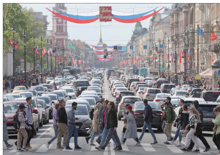
برى معهد التمويل الدولي أن العقوبات المفروضة على موسكو تقوّض ثلاثة عقود من التكامل مع الغرب

بإستثمارات جديدة تخدم أهداف روسيا، بما في ذلك من خلال مشتريات في السوق الثانوية... لكن القواعد ما زالت تسمح للمستثمرين الأميركيين ببيع أو مواصلة حيازة أصول روسية يملكونها بالفعل. لكن في مقابل التصعيد، أفادت هيئة الإحصاء الروسية، الأربعاء، بأن معدل التضخم السنوي في البلاد تراجع إلى 17,1 في المائة في مايو (أيار) بعد وصوله إلى أعلى مستوياته منذ عقدين في أبريل (نيسان) حين سجل 17,8 في المائة. وقالت «روسنستات» إن تضخم أسعار المواد الغذائية الذي يعد مصدر قلق كبير للمواطنين الروس من أصحاب الدخل المنخفض، ارتفع إلى 21,5 في المائة على أساس سنوي الشهر الماضي، مقابل 20,5 في المائة في أبريل. وأظهرت البيانات أن أسعار السكر ارتفعت بنسبة 61,4 في