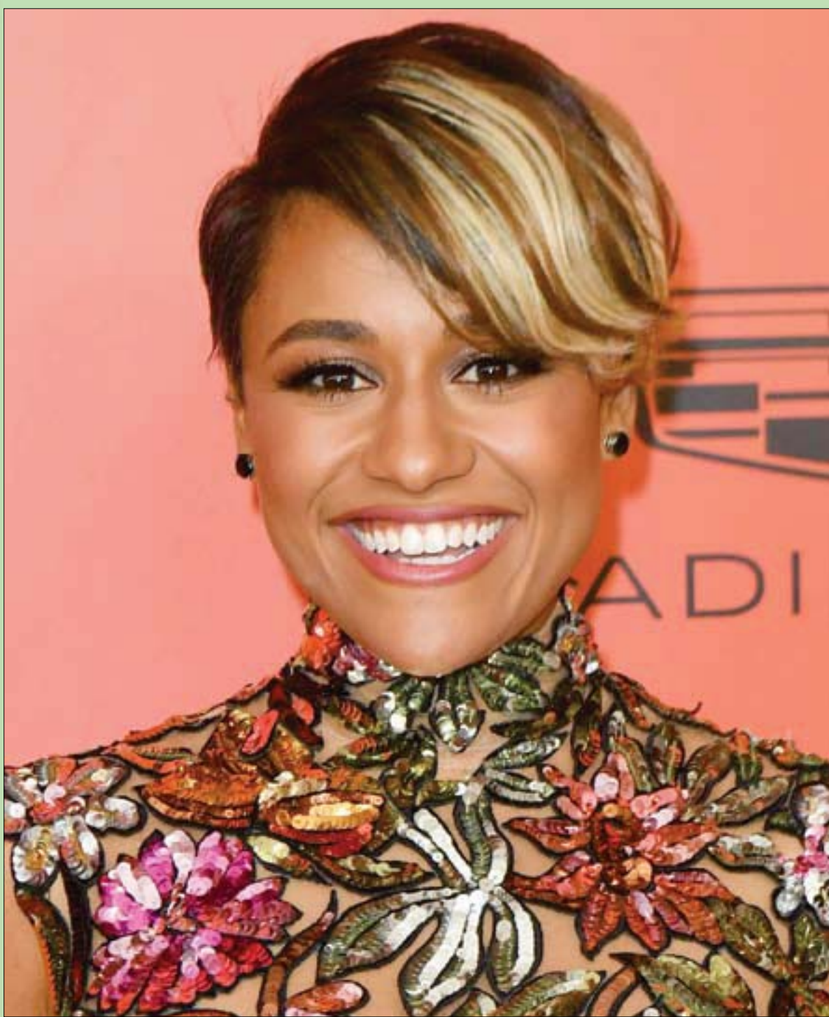
الممثلة الأميركية أريانا ديبيز تصل إلى حفل «تايم 100 غلا» في مركز لينكولن في نيويورك

حسناً... أين قدسية حقوق الإنسان، وحرية التعبير، وحق اللجوء السياسي؟ وماذا لو فعل بعض الدول العربية ربع هذا الفعل؟