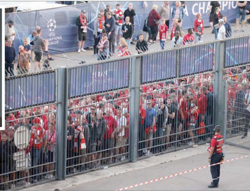
جماهير ليفربول حوصرت خارج أسوار ملعب باريس وتعرضت للضرب من رجال الأمن

من دون تذاكر أو بتذاكر مزورة. وقال لولو، في هذا الإطار، إنه مسؤول عن هذا الرقم، واستند في ذلك إلى الأرقام التي قدمتها شركات النقل في باريس