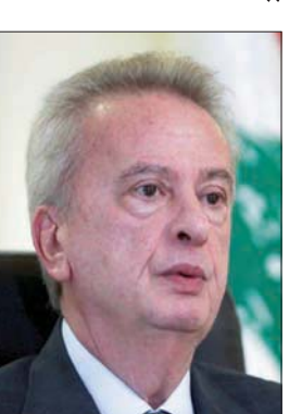
رياض سلامة

به، إلا أن الأخير لم يتخلع ضمنون هذه الدعوى التي تستوجب رفع يده عن الملف، وأحال القضية على المرجع القضائي المختص للنظر فيها.