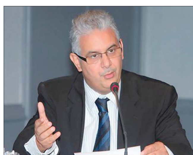
نزار بركة الأمين العام لحزب الاستقلال

حواضر الصحراء المغربية، الذي يسعى من خلالها إلى الحفاظ على حضوره القوي في مؤسسات الحزب. وحسب مصدر في الحزب، فإن معظم التعديلات على قوانين الحزب استهدفت في المرحلة السابقة تمكين انصار ولد الرشيد من الوصول إلى مختلف مناصب المسؤولية في الحزب، ومن ذلك تخفيف شروط الترشح للجنة التنفيذية، واعتماد عضوية النواب في المجلس الوطني بالصفة، خاصة أن النواب الذين يمثلون أقاليم الصحراء المغربية كانوا يمثلون نسبة مهمة داخل الحزب. لكن بعد انتخابات سبتمبر (أيلول) 2021 تغيرت الخريطة داخل الحزب، بعد أن حل في المرتبة الثالثة وطنياً في مجلس النواب بحصوله على 81 مقعداً، وهو أكبر عدد من المقاعد يحصل عليه الحزب منذ بدء مشاركته في الانتخابات المغربية. وأمام هذا الوضع فإن المجلس الوطني للحزب بات يضم 81 نائباً جديداً بالصفة، معظمهم لا يدين بولاء لولد الرشيد وانصاره. في الحزب، إن التعديلات ترمي لإبقاء نفوذ ولد الرشيد داخل الحزب، ونفادي صعود نخب جديدة لهايكله ومؤسساته، خلال المؤتمر المقرر نهاية العام الجاري، والذي سينتخب قيادة جديدة.