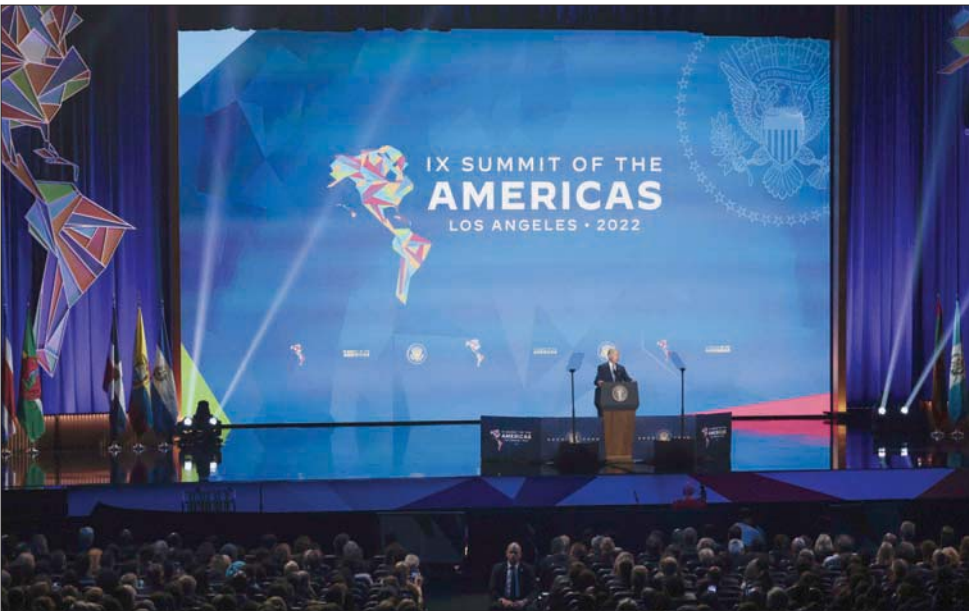
الرئيس الأميركي جو بايدن يفتتح قمة الأميركيين في لوس أنجلوس أول من أمس (أ.غ.ب)

وقال معهد الأبحاث الأميركي إن إرقامه تولى على أن الرئيس الصيني شي جينينغ زار أميركا اللاتينية 11 مرة منذ توليه رئاسة بلاده في 2013. في المقابل، لم يزر الرئيس الأميركي جو بايدن أميركا اللاتينية بعد منذ تسلمه منصبه الرئاسي في يناير (كانون الثاني) 2021.