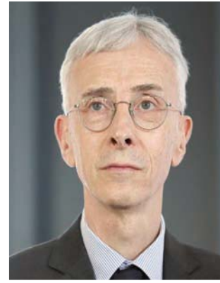
لولو أباد قائد شرطة باريس

مسؤولة لكن شرطة الشعب الفرنسية عاملتهم بقسوة. وكان كل من نادي ليفربول وريال مدريد طرفي النهائي قد طالبا الاتحاد الأوروبي للعبة (يويفا) بتوضيحات بشأن كيفية إعداد التقرير المرتقب بشأن حالة الفوضى التي سبقت المباراة النهائية لدوري الأبطال ومعرفة المعايير التي تبنى عليها اختيار ملعب سان دوني الفرنسي لاستضافة اللقاء في ضوء ما حدث في هذا اليوم. وكان يبلي هوغان، الرئيس التنفيذي لليفربول، قد استنكر تحميل مسؤولي الأمن في باريس لجماهير فريقه مسؤولية أحداث الأسبوع وقال، في بيان، الأسبوع الماضي: «طالبنا بإجراء تحقيق بشأن ما حدث في باريس، وليس تقريراً، فأنا إن معظم مشجعي الفريق الإنجليزي تصرفوا بصورة