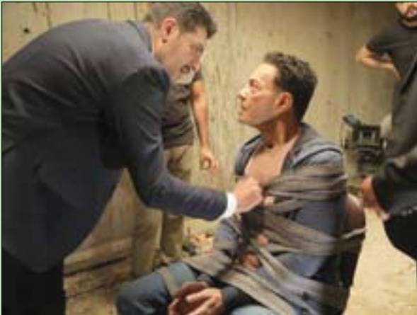
لقطة من فيلم «فارس»