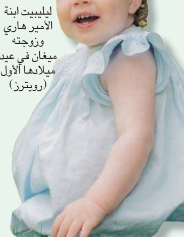
ليليبيت ابنة الأمير هاري وميغان في عيد ميلادها الأول

ومن بين الهدايا التي تلقفتها ليليبيت في عيدها الأمير تشارلز لأنه قدم نفس الهدية لحفيده الأمير جورج في عيد ميلاده. ولم يحضر الأمير وليام وزوجته حفلة عيد الميلاد لأنهما كانا بميلان الملكة في ويلز، وانقصر الحفل على مشاركة زارا ومايك تينيدال وأبنائهما الثلاثة، وبحسب المعلومات التي نشرت في الصحف، فالحفلة كانت متواضعة تخللها الرسم على وجوه الصغار واللعب في حديقة البيت.