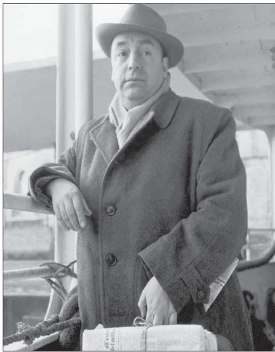
بابلو نيرودا... اعترف في مذكراته باغتصابه فتاة سريلانكية

التي كشفت الوثائق الرسمية بعد سنوات أنها كانت وراء الانقلاب وتعذيب عشرات الآلاف من المعارضين السياسيين. يوم رحل نيرودا، لم تكن الحركة النسائية قد انتشرت وترسخت في تشيلي كما حصل بعد سقوط الديكتاتورية العسكرية، ثم وصول المناضلة الاشتراكية ميشيل باشليه إلى رئاسة الجمهورية، وتشكيل الحكومة التشيلية الأخيرة بأغلبية من النساء.