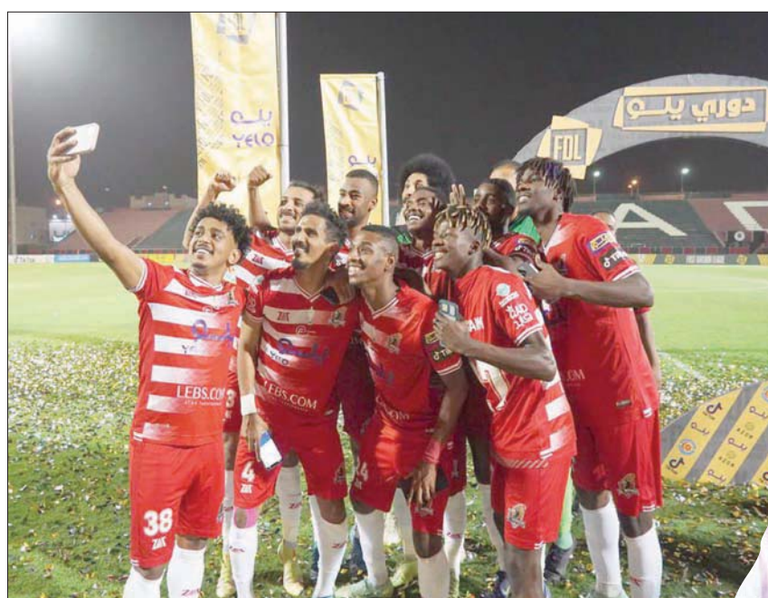
إدارة الوحدة عليها مسؤوليات كبيرة لتحقيق تطورات جماهيرها في مكة (الشرق الأوسط)

بين موسم الصعود الحالي والهبوط قبلها بموسم، منحت هذه التجربة درساً كبيراً لإدارة نادي الوحدة، أن المال وحده لا يكفي تماماً لتحقيق المنجز، خاصة في ظل التقارب الفني بين فرق دوري المحترفين