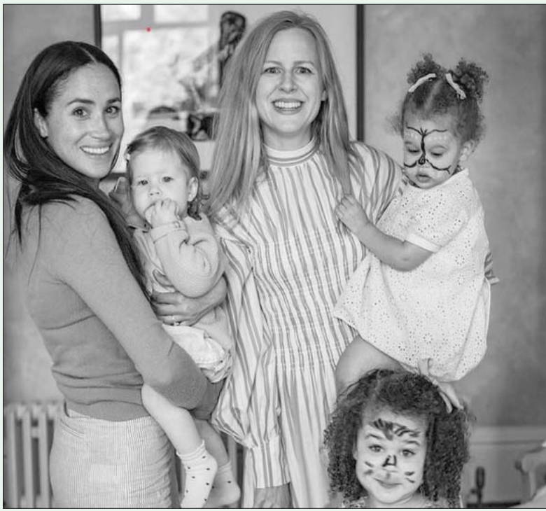
ميغان ماركل تحمل ابنتها ليليبيت مع كاميليا زوجة الصور هارمان هولستروم مع ابنتها خلال حفل عيد الميلاد في ويندسور (حساب ميغان هاريمان الرسمي)

لندن، جوسلين إيلا أحضرا معهما ابنتهما آرثشي وابنتهما ليليبيت التي صافد عيد ميلادها خلال الاحتفال باليوبيل الثانية للعرش لحظ الدقة في اختيار كل لقطه وكل خطوة، على رأسها الحد من ظهور الأمير هاري وزوجته ميغان ماركل ومشاركتهما الوحيدة في قداس الشكر في كاتدرائية سانت بولز وعدم السماح لهما بالوقوف على شرفة قصر باكنغهام إلى جانب الملكة وولي العهد والأمير وليام كما درجت العادة، الأمر لم يكن صدفة إنما كان مخططاً له من قبل الملكة ذاتها التي يقال إن علاقتها لم تعد لها ما يرام مع حفيدها الأمير هاري لعدة أسباب، أهمها المقابلة التلفزيونية التي أجراها مع زوجته ميغان مع أوبرا وينفري والانتقادات والتهامات المسيسة التي وجهها للعائلة الملكية، كما يداع بيان الملكة التي أعزجت من إطلاق اسم «ليليبيت» على ابنتها، وهذا الاسم هو اسم الدلع الذي أطلق على الملكة منذ أن كانت طفلة، وبحسب معلومات رشحت عن القصر فالملكة أعلنت بالأمير ولكنها لم تسال عن رأيها ولم تعط موافقتها على ذلك.