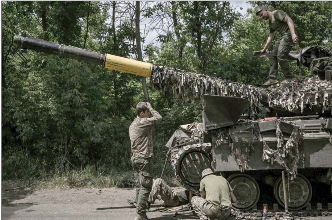
جنود أوكرانيون يصلحون دبابة في دونباس

الظروف اللازمة لاستئناف حركة القطارات بين روسيا ودونباس، وبين أوكرانيا وشبه جزيرة القرم في 6 أجزاء من خطوط السكك الحديدية، فيما بدأ بالفعل إيصال الشحنات إلى ماريوبول وبيرديانسك وخيرسون». ترأست مجموعة لقوات العدو الوزير مع إعلان رئيس الشيشان رمضان قديروف، الذي تقوم قواته الإقليميين مشيرات على اقتراب «معركة دونباس» من الحسم، خصوصاً مع إطلاق موسكو ما وصفه بأنه «هجوم شامل» زجت فيه وحدات إضافية في القوات النظامية ومجموعات جديدة من المتطوعين من الشيشان ومناطق أخرى. وجاء إعلان شويغو عن «تحرير» مدينة سفيتاغورسك في دونيتسك، ليتراف مع تقدم واسع في المدينة الاستراتيجية سيفيرودونيتسك وهي المعقل الأوكراني الأخير في لوغانسك. وقال شويغو خلال اجتماع للقيادة العسكرية: «تم تحرير جزء كبير من جمهورية دونيتسك ولوغانسك الشيعيتين على طول الضفة اليسرى لنهر سيفيرسكي بوتيفس؛ بما في ذلك مدينتا كراسني ليمان وسيفياتوغورسك، بالإضافة إلى 15 بلدة أخرى». وأكد أنه تم أيضاً «تحرير المناطق السكنية في مدينة سيفيرودونيتسك في لوغانسك بشكل كامل». وقال إن «بسط السيطرة يتواصل على المنطقة الصناعية للمدينة وعلى البلديات المجاورة، كما يتطور الهجوم على محور بوباسانيا». مضيفاً أنه