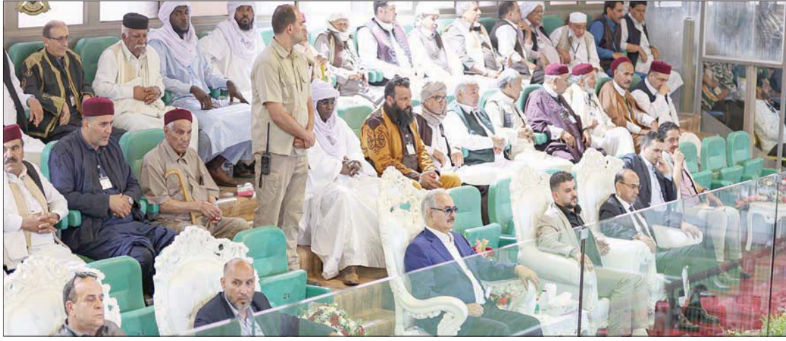
حفر حفتر خلال الاحتفال بذكرى «شهداء عملية الكرامة»

وقال المهندس يعلمان في الحقن إن إنتاجه توقف مجددا في ساعة متأخرة من مساء أول من أمس، بعد استئناف لفترة وجيزة، علما بأن المؤسسة النفطية للنفط قدرت خسائر المترتبة على إغلاق حقلي الشارة والغيل بحوالي 160 مليون دينار ليبي يوميا، أي أكثر من 34 مليون دولار.