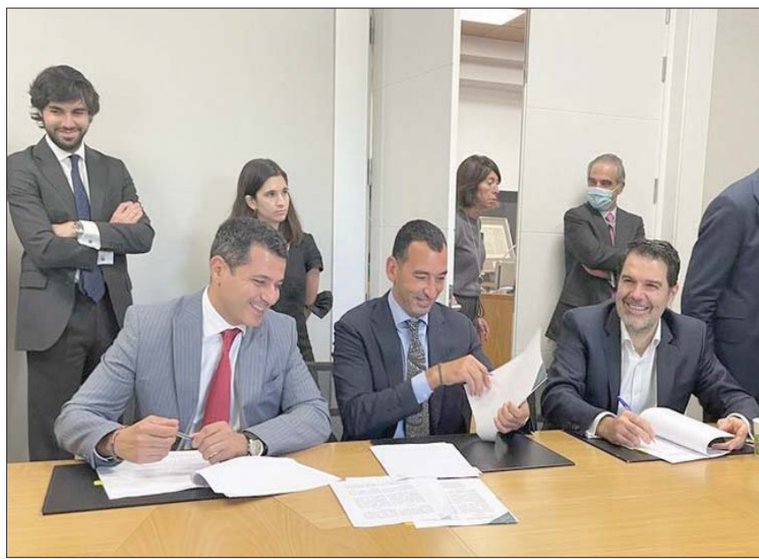
ممثلون من «فورتكس إنرجي» و«إجنيس إنرجيا» خلال توقيع الاتفاقيات

وفي ذلك الإطار، دخلت شركة «إجنيس» حاليا مرحلة التجهيزات لإطلاق منصة مخرجة تبلغ 500 ميغواط تقريباً، كما