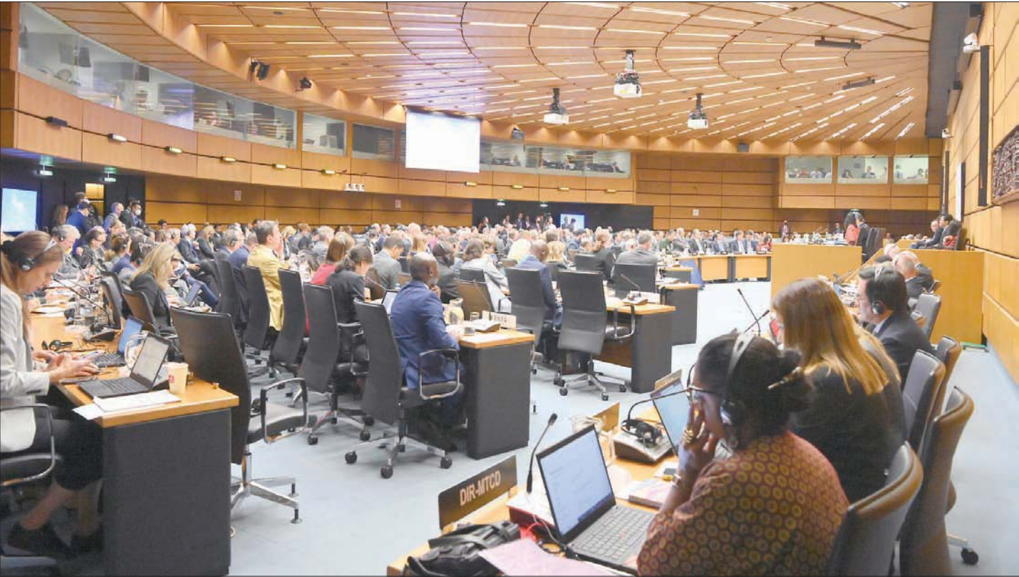
صورة وزعتها «الطاقة الذرية» من انطلاق اجتماعها الفصلي في فيينا أول من أمس

فيينا: راعدة بهنام لندن - طهران، «الشرق الأوسط»