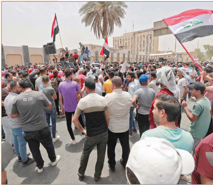
عراقيون يتظاهرون ضد سياسة التوظيف الحكومي قرب مقر البرلمان في بغداد أمس

وفي مجال معالجة قضية المناخ والتصحر قال الكاظمي إن «العراق جزء من مشروع الشرق الأوسط الأخضر حيث سنقوم بزراعة 60 مليار شجرة» مبيّناً أن «المملكة العربية السعودية تبرعت للعراق بالكثير على صعيد زراعة هذه الأشجار لمكافحة التصحر وأزمة المياه والمناخ التي لم تعالج بشكل جيد في العراق خلال الفترات الماضية وهو ما جعلها تستفحل كثيراً ما تطلب بذل جهود إضافية في قيام المجال».