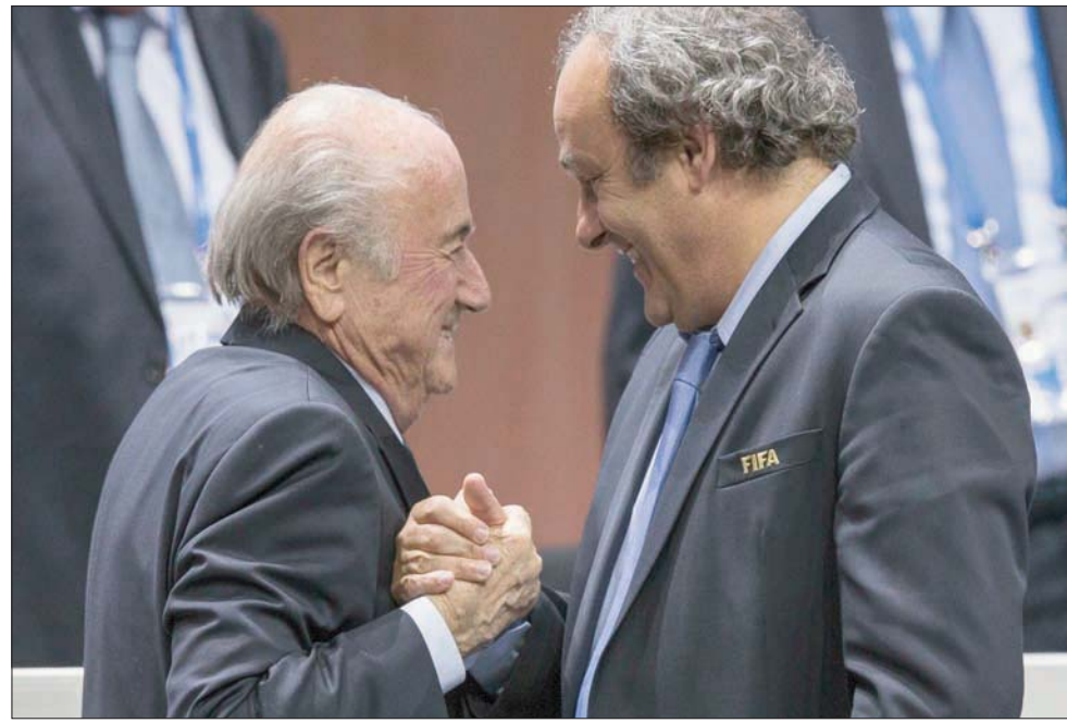
بلاتر وبلايني من صديقين مقربين إلى غريمين أمام المحاكم

كامل ونهائي بعد سنوات عديدة من الاتهامات والافتراءات، سنخبت في المحكمة انني تصرفت بامانة شديدة، وان دفع الجزء المتبقي من الراتب كان مستحقاً من (فيفا)، وهو قانوني تماماً»، من جانبه قال بلاتر: «تعود هذه القضية إلى حدث في 2011. إنها مسألة إدارية، دفع راتب مستحق. تمت الإعلان عن الأمر بشكل صحيح كدعوى راتب، وتم احتسابه وفقاً لذلك، ووافقت عليه جميع الهيئات ذات الصلة في (فيفا)». وانضم بلاتر إلى «فيفا» عام 1975، وأصبح أمينه العام في 1981، ورئيساً له في عام 1998، قبل أن يجبر على التنحي من منصبه في عام 2015، وعقب من قبل الاتحاد الدولي لكرة القدم، بحسب ما قالت محامية الاتحاد الدولي، مي هول-شيرازي. وقال دومينيك نيلين محامي بلاتيني: «المحاكمة السويسرية لم تكن كانت نتيجة مؤامرة تهدف لمنعه من رئاسة (فيفا)». وأضاف: «ننق في أن هذا الإجراء سيؤدي إلى نتيجة إيجابية، ستظهر إخلاص بلاتيني الكامل في هذه المسألة. هدف تلك القصة كان إبعاده عن المنافسة على رئاسة الاتحاد الدولي». وقال بلاتيني: «انتعاش دوره الاستشاري، فإن بلاتيني «طالب بمبلغ مليوني فرنك»، وفق المكتب أيضاً. ويصنّ الرجلان على 1999 مقابل راتب سنوي قدره 300 ألف فرنك سويسري (كان بلاتيني قد أصدر فاتورة به في كل مناسبة، ومع ذلك، بعد أكثر من 8 سنوات