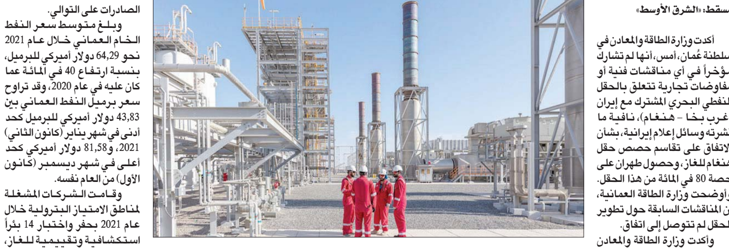
مسقط، «التشرق الأوسط» ارتفع الاحتياطي من النفط الخام والمكثفات النفطية في سلطنة عمان (العمانية)

البروفيزيائية واختبار إنتاجية الأبار عن مؤشرات إيجابية في عدد منها، والذي أضاف احتياطات جديدة للغاز». وأكد في تقرير نشرته وكالة الأنباء العمانية، أن الوزارة اشترت على تنفيذ العديد من المشاريع مع الشركات المشغلة للنفط والغاز والتي تهدف إلى تطوير الحقول وضمان التحسن المستمر من خلال أحدث التقنيات وإقامة المشاريع التي تضيف الجودة وتضمن الاستمرارية في الإنتاج. ومن أبرز هذا المشاريع لدى الشركات المشغلة: تدشين مشروع جبال خف الذي يعد ثاني أكبر مشاريع شركة تنمية نفط عمان ومشروع المضخات الإضافية لحقل المياه، والذي يهدف إلى تركيب مضختين كهربائيتين لحقل المياه، كما واصلت جهودها في برنامج القيمة المحلية الذي ساهم في زيادة الإنتاج نفسها من النفط تماشياً مع اتفاق خفض الإنتاج والمتوسطة بنسبة بلغت ما يقارب 14 في المائة من إجمالي الإنتاج. وأشار التقرير الصادر عن وزارة الطاقة والمعادن إلى أن الشركات المشغلة لمناطق الامتياز البترولية قامت خلال عام 2021 بحفر واختبار 66 بئراً استكشافية وتقييمية للنفط، وتشمل بعض الآبار التي تم حفرها مسبقاً وخضعت لأختبار والتقييم هذا العام. وقد أسفرت نتائج التحاليل