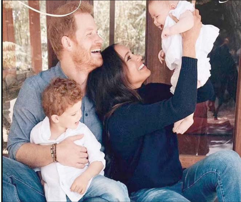
صورة للأمير هاري مع زوجته وابنة آرثشي وابنته ليليبيت في منزلهما في الولايات المتحدة