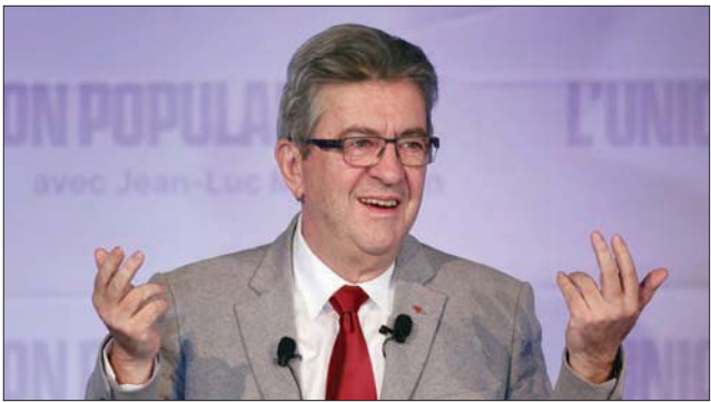
جان لوك ميلونشون

البرلمان، يعكس ما حصل عليه في انتخابات العام 2017 حيث تمتع بأكثرية قضاة، مكّنته من فرض السياسات والخيارات التي ارادها. وإذا فشلت كتلته في إحصال