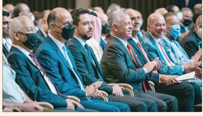
كشف الأردن بحضور الملك عبد الله الثاني عن استراتيجية رئيسية لتنمية البلاد للسنوات العشر القادمة

عمان، «التشرق الأوسط» تمكن القطاع الخاص ولا نمتلك ترف أن نضع معوقات أمام المستثمرين... هذه الرؤية ترتكز إلى تمكين الاقتصاد والقطاع الخاص لإيجاد فرص العمل ورفع المهارات وتمكين الابتكار». وأضاف قائلاً: «تمكين القطاع الخاص أصبح ضرورة لتحقيق نمو اقتصادي وإيجاد فرص عمل للخطة والخطط وخططنا لإصلاحات دفعها الملك عبد الله الثاني منذ العام الماضي لمساعدة البلد المستورد للنفط في الارتداد عن عقد من نمو راكد يحوم حوالي اثنين في المائة فاقمته الجائحة والحرب في الجارين العراق وسوريا، وفي حفل حضره الملك يوم الإثنين، تم الإعلان عن (رؤية التحديث الاقتصادي) التي تهدف لاجتذاب 41 مليار دولار في تمويل مساعد في زيادة الناتج المحلي الإجمالي للأردن إلى 58,1 مليار دينار (82 مليار دولار) بحلول عام 2033 من 30,2 مليار دينار حالياً. وقال رئيس الوزراء بشر الخصاونة إنه ملتزم بتنفيذ إصلاحات أساسية لسوق الحر يقول رجال أعمال إن إدارات محافظة سابقة أحبطتها طويلاً. وأبلغ الخصاونة حشداً ضم مئات رجال الأعمال والمسؤولين العموميين والساسة دعاهم البلاط الملكي للمشاركة في إجراءات تقشفية أثارت اضطرابات