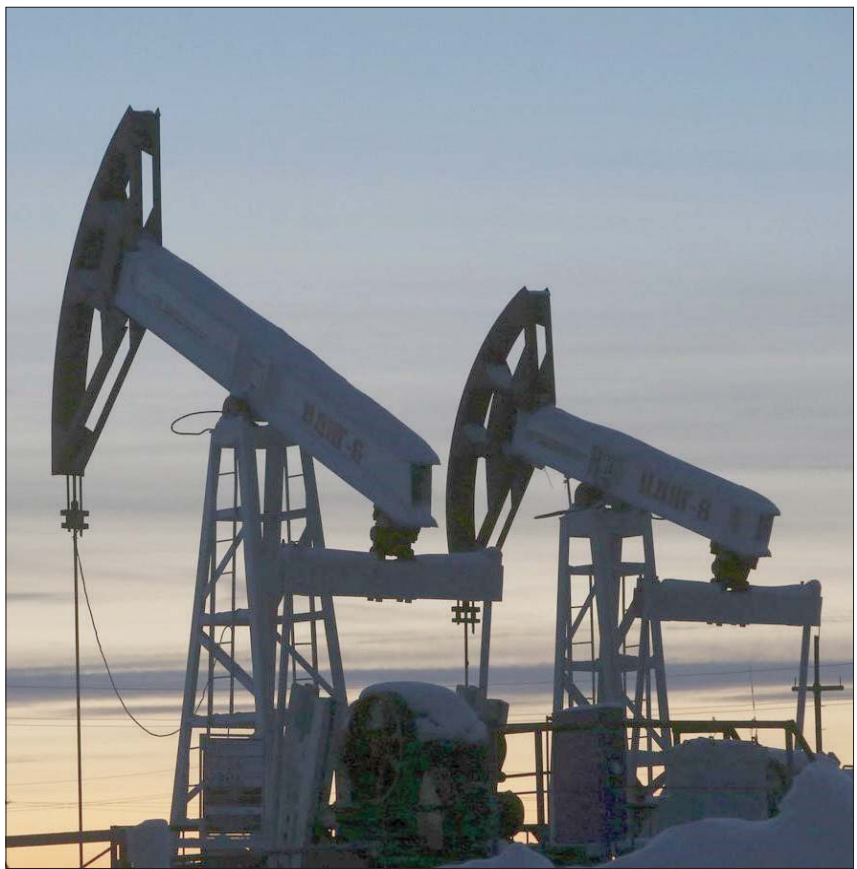
إيرادات روسيا من تصدير النفط تتراجع رغم ارتفاع صادراتها البحرية إلى أعلى مستوياتها منذ 6 أسابيع

دولار للبرميل بحلول الساعة 1209 بتوقيت غرينيتش. كما انخفضت العقود الآجلة لخام غرب تكساس الوسيط الأمريكي 35 سنتاً، أي 0,3 في المائة، إلى 118,15 دولار للبرميل، بعد أن ارتفعت بأكثر من دولار واحد للبرميل في وقت سابق من الجلسة. وقال جيوفاني ستونوفو المحلل في (يو بي إس): «الشهية للمخاطرة هي المسؤولة عن التراجع، وأسواق الأسهم الأوروبية سلبية». كما أقر تفويض وزارة الخارجية الأميركية لإيني ورييسول لبدء شحن الخام الفنزويلي إلى أوروبا اعتباراً من يوليو (تموز) لتعويض تراجع الإنتاج الروسي على الأسعار في الأيام القليلة الماضية.