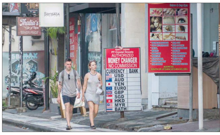
ارتفعت أعداد السياح على مستوى العالم 3 مرات في الربع الأول من العام على أساس سنوي (إب أ)

الخطية الخمسية تهدف إلى استعادة مليارات الدولارات من عائدات السياحة التي خسرتها خلال وباء «كوفيد-19».