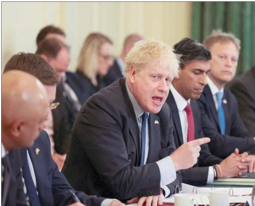
بوريس جونسون خلال جلسة مجلس الوزراء أمس

يسعى رئيس الوزراء البريطاني بوريس جونسون الذي بات في موقع أضعف على الرغم من احتفائه بمنصبه بعد تصويت لحجب الثقة في مجلس العموم، إلى طي صفحة الفضائح ليتكبد على معالجة مشكلات «مهمة»، ووص صفوف حزب منقسم وإعادة كرس تأييد البريطانيين.