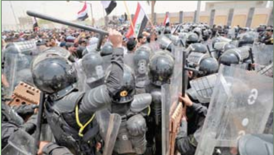
الأمن العراقي يفرض مظاهرات احتجاجية ضد البطالة في المنطقة الخضراء ببغداد أمس (أ.ف.ب)

العراق، خلال الفترات الماضية، وعلى الصعيد الداخلي، أثم الكاظمي أطرافاً لم يسلمها بأنها «تعمل من أجل عرقلة عمل الحكومة بأي طريقة لكي لا يحسب لها أي نجاح، بينما الوقائع على الأرض تثبت العكس برغم أن عمر هذه الحكومة سنجان فقط». وقال: «بسبب اضطراري للدخول في تفاصيل عمل الحكومة، فقد تحولت إلى معقب معاملات».