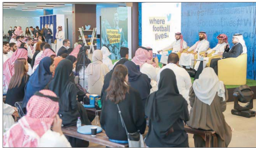
جانب من المحادثات التي استضافها ملعب النصر (مرسلو بارك) برعاية شركة تويتر (الشرق الأوسط)

واستضافت شركة تويتر فعالية في مقر فريق النصر لكرة القدم (مرسلو بارك) في العاصمة الرياض، وذلك لتسليط الضوء على أحداث كرة القدم على المنصة، وتوضيح قيمتها للعلامات التجارية والشركات العاملة في مجال الإعلان والتسويق، وهدفت الفعالية بعنوان «تويتر هو مكان محادثات كرة القدم» لتشجيع العلامات التجارية على الاستفادة من المحادثات الكروية المتزايدة والاهتمام الكبير بالحدث الرياضي الأبرز في عالم كرة القدم والذي سيتابعه ملايين المشجعين حول العالم. وركز الحدث على الطرق التي يمكن للعلامات التجارية من خلالها التواصل مع اللخطات الثقافية التي يتحدث عنها الناس والتفاعل معهم بالوقت المناسب وبشكل لحظي. وكان تويتر قد قام بإجراء استطلاع ميداني بالتعاون مع شركة «جي دبليو إي» المختصة لفهم ما يفكر فيه الناس حول كأس العالم بشكل أفضل، وتحدثت الشركة مع أكثر من 12 ألف شخص في 12 سوقاً بما في ذلك منطقة الشرق الأوسط وشمال أفريقيا. وخلص الاستطلاع إلى عدة