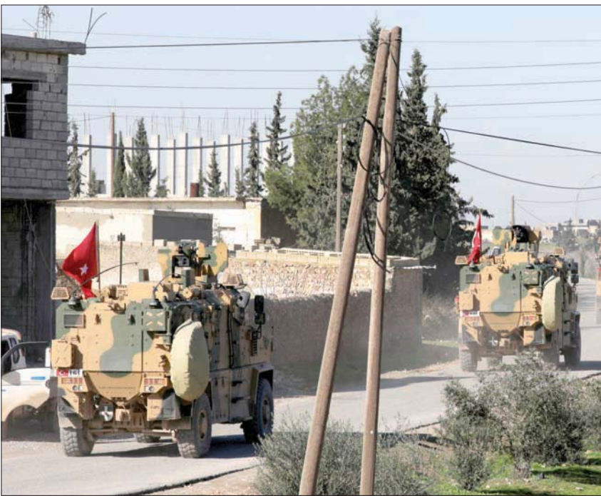
قوات تركية في ريف منبج بشمال سوريا في 29 ديسمبر 2018