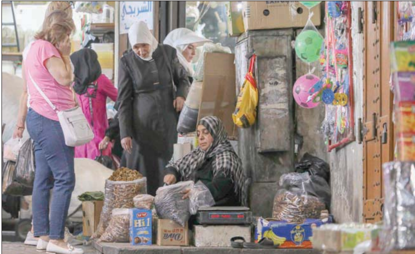
سوريون يتسوقون في إحدى أسواق دمشق القديمة أول من أمس

وأشارت «الهيئة» في البيان إلى أنه في إطار عملها لضمان استمرار عمل شركات الاتصالات وخدماتها بما يتناسب مع الظروف الحالية الناتجة عن تداعيات «قانون قيصر» وارتفاع