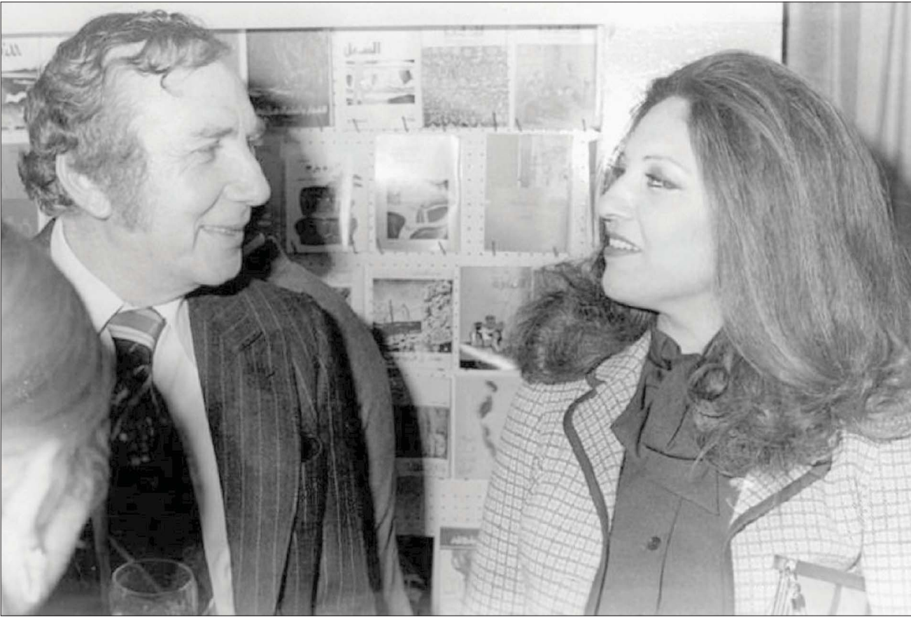
بليقيس الراوي ونزار قباني

الغيرة المدمر. ومع أن الزوجة المعتدة بكرامتها، كما بجمالها وذكاؤها اللامح، لم تكن بمنأى عن لسعة الغيرة التي تطلت لها من حال زوجها نزار، إلا أنها عملت كل ما بوسعها لكبح جماح تلك الغيرة وإيقانها تحت السيطرة، بإذلة كل جهدها لتجنب الوقوع في المطب نفسه الذي وقعت فيه زوجة الشاعر الأولى. ولعل قباني يقصد هذه النقطة بالذات في قصيدته المعروفة «أشهد أن لا امرأة إلا أنت»، التي كتبها لبليقيس في عيد زواجها العاشر، كما تشير بعض الدلائل، من مثل «أشهد أن لا امرأة اتقنت اللعبة إلا أنت واحتملت حماقتي عشرة أعوام كما احتملت واصطبرت على جنوني مثلما اصطبرت».