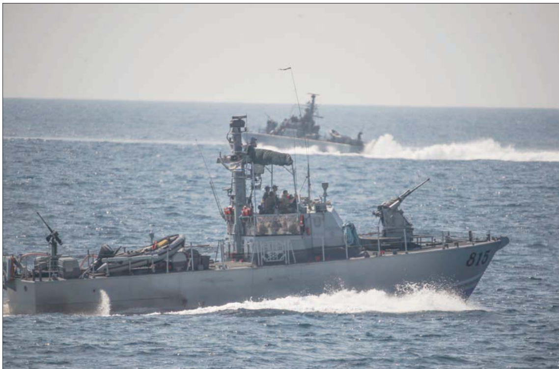
باخرتان حربيّتان للبحرية الإسرائيلية مقابل الشواطئ اللبنانية أول من أمس الاثنين (إ.ب.أ)

بيروت، نذير رضا Power قبالة المنطقة الحدودية البحرية المتنازع عليها. وأفادت بان الوسيط الأميركي (سبيل) إلى بيروت خلال نهاية الأسبوع الجاري أو بداية الأسبوع المقبل، بناء على طلب الجانب اللبناني لترسيم الحدود البحرية والعمل على إنهائها في أسرع وقت ممكن». وقالت إن عون تلقى تقارير من قيادة الجيش حول تحركات السفينة قبالة المنطقة الحدودية البحرية.