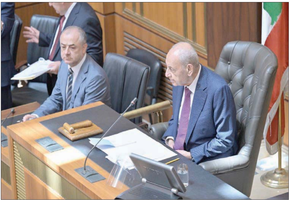
الرئيس نبيه بري ونائب رئيس المجلس إلياس بو صعب في جلسة البرلمان أمس (الشرق الأوسط)

هو تكريس للعملية الديمقراطية بعدما كان يتم الاتفاق والمحاكمة على توزيع اللجان النيابية بين الكتل الكبرى، معتبراً في الوقت عينه أن عدم إحداث تغيير كبير في توزيع اللجان الأساسية وإن كان نتيجة اتفاق الكتل الكبيرة فيما بينها، لا يمكن اعتباره خرقاً للقانون أو للمواضع الديمقراطية. وضيف «من الواضح أن الأحزاب صوتت لمرشحي بعضها البعض وبالتالي فوزها كان أكبر لأن حضورها في البرلمان أكبر لكن هذا لا يعني أن النواب الذين لم يحالفهم الحظ لن يشاركون في اجتماعات اللجان بل سيكونون حاضرين فيها وفق ما يسمح لهم به القانون وسيكونون العين المراقبة التي تتابع وتعترض وتنقل الصورة إلى الخارج».