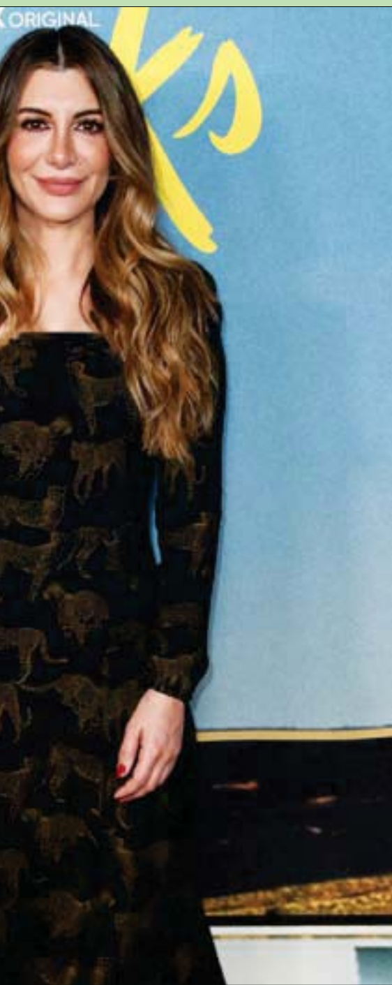
الممثلة الإيرانية الأميركية نسيم بيدراد لدى حضورها العرض الأول للموسم الثاني من المسلسل التلفزيوني «هاكس» في ويست هوليوود بكاليفورنيا