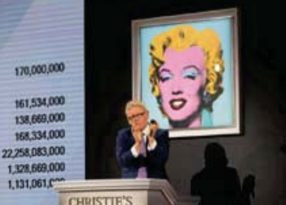
مدير «كريستيز» يصفق بعد انتهاء مزاد «شوت سايج بلو مارلين» للرسم أندي وارمول

من ضمن مجموعة أعمال طرحتها للبيع مساء أول من أمس (الآنين)، مؤسسة توماس ويوريس أمان في زيورخ، التي تحمل اسم صديق وارمول، تاجر الأعمال الفنية وهاوي الجمع السويسري، توماس أمان الذي توفي بمرض الإيدز عام 1993 وشقيقته دوريس. وستخصص كل إيرادات