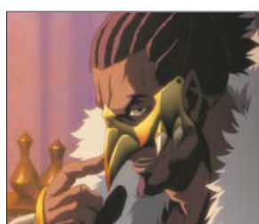
استوحيت فكرة فيلم «الرحلة» من تاريخ شبه الجزيرة العربية