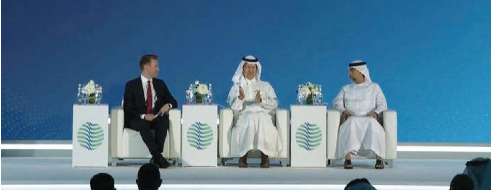
الأمير عبد العزيز بن سلمان وسهيل المزروعى خلال مشاركتهما أمس في مؤتمر متخصص بالمرافق في أبو ظبي

ولفت في الوقت نفسه إلى أنه لا يوجد حالياً نقص في إمدادات النفط، وبالتالي فإنه لا توجد حاجة لقيام تحالف «أوبك» بتسريع الزيادة التدريجية في الإنتاج، مضيفاً أن «السوق متوازنة».