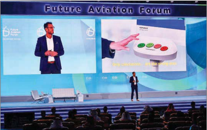
جانب من مؤتمر مستقبل الطيران المدني (الشرق الأوسط)