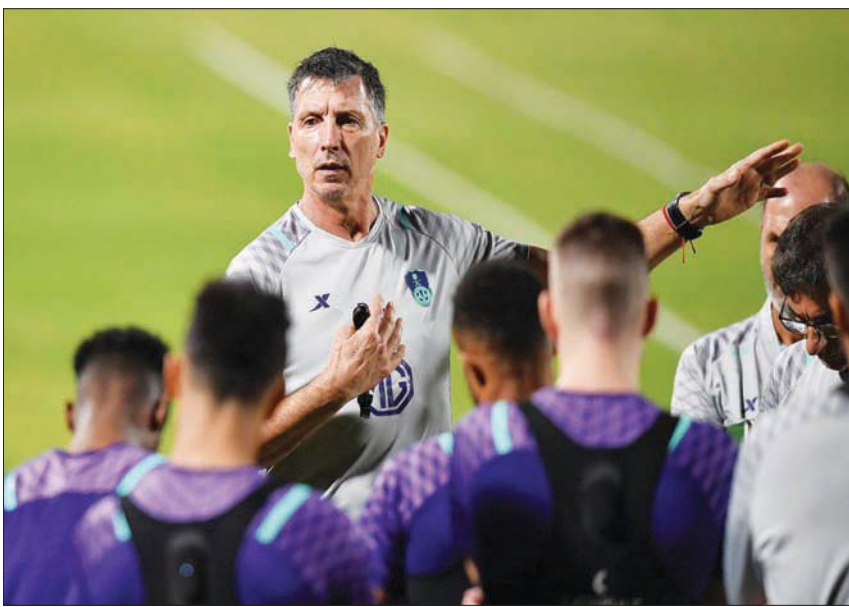
جانب من تدريبات الأهلي الأخيرة