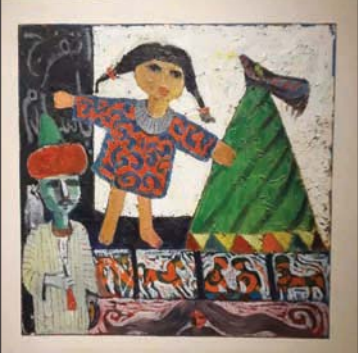
لم يكتفِ القاضي بالتنامغات التي تمنح البصر بل وصل إلى مستويات رمزية بيئية

يبرز في أعمال المعرض، كما المعارض السابقة، اهتمامه بالمكان، وهو ما يفسره قائلاً: «لقيمته الجمالية والروحية؛ خصوصاً الأحياء القديمة التي سجلنا ذكرياتنا على جدرانها، حملت شوارعها أصلامنا؛ ولذلك تسكننا، ونشم رائحة أيامنا في حواربها». ومن الأمثلة التي تحتل مساحة كبيرة في فنه الواحات، التي يقول عنها: «سافرت إليها، وارثشتفت من نبع الجمال الصافي البكر الموجود فيها، ورأيت الأفق الممتد الذي يحضن الكتبان الرملية المنقرقة، التي تبدو وكأنها عرائس تفتش البساط الذهبي». ويتابع: «ما زالت الواحات عالقة في ذاكرتي بامكانها المختلفة؛ حيث مقابر البجوات والمعادب والجمال والصخور والنخيل، ومناجم المياه المتدفقة، ومدينة (القصر) بتأثيرها الساحر لما تحمله من إحساس ميتافيزيقي فريد». ورغم أنه يبدأ رسوماته من أرضية واقعية تتضمن عناصر موجودة في البيئة المصرية، فإنه يأخذنا إلى واقع جديد ذي سحر خاص، عبر إعادة صياغة هذه العناصر من نيمات محلية وشعبية باستخدام فيض الخطوط والألوان، يقول: «إن الحضارة المصرية سعيد الحظ، لأنه ابن لإرث حضاري ممتد آلاف السنين من العصر البدائي، مروراً بالفراعوني، ووصولاً إلى الحضارة المعاصرة، بكل ما تشمله من قلق وسرعة مضطربة وتطور، فكل هذا يؤثر فيه، فيراه ويخزنه ويصهره في بوتقة إبداعه».