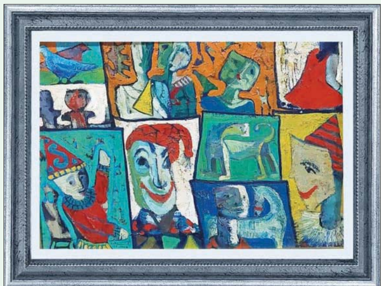
حياة القاضي مقسمة بين القاهرة والمنايا

ينسج الفنان رؤية خاصة للإنسان تفيد بأنه خلال جميع العصور والحضارات المختلفة، التي من بها، لم يتوقف يوماً عن الحلم واستشراف المستقبل، فالمعرض الذي يحمل عنوان «سفر الأحلام» يتنقل بين