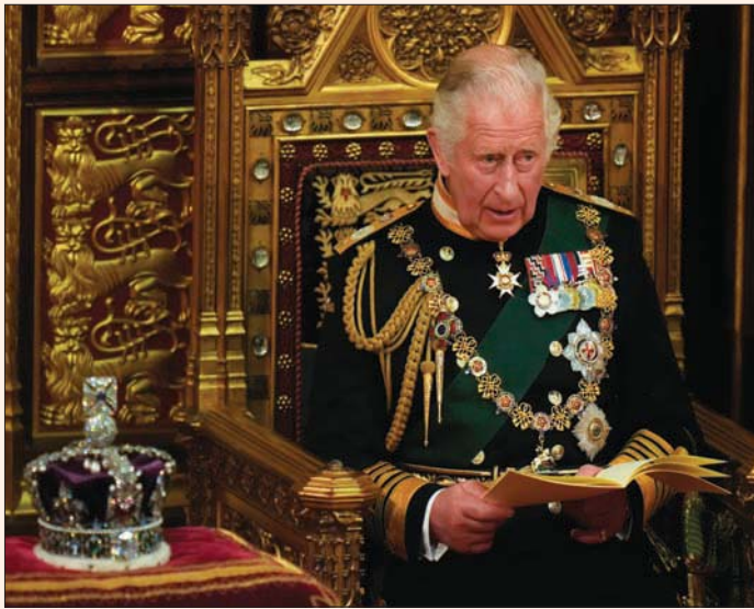
الأمير تشارلز يقرأ خطاب الملكة بجوار تاجها خلال الافتتاح الرسمي للبرلمان أمس (أب)

تغيبت الملكة إليزابيث الثانية (96 عاماً) مرتين فقط خلال فترة توليها العرش عن جلسة افتتاح البرلمان البريطاني، مرة في العام 1959 حين حملت بالأمير أندرو، ومرة في العام 1963 حين حملت بالأمير إدوارد. كما أنها المرة الأولى التي يحل فيها أمير ويلز مكانها، وتزايد مظهرها في الخارج منذ سنوات وتزاد مهامه. «لا تزال تتولى زمام الأمور، لكن لا تختلطوا بهذه لحظة تاريخية للملكة». وأثار قرار الملكة الإثنين بالتغيب مخاوف إزاء عدم تمكنها من حضور احتفالات الشهر المقبل بمناسبة الذكرى السبعين لاعتلائها العرش. الأسبوع الماضي أعلنت الملكة أنها لن تحضر الحفلات التي ستقام في حديقة قصر باتنگهام هذا الصيف. وكان آخر ظهور علني لها في 29 مارس (آذار) خلال حفل تأبين زوجها الأمير فيليب الذي توفي عن 99 عاماً العام الماضي.