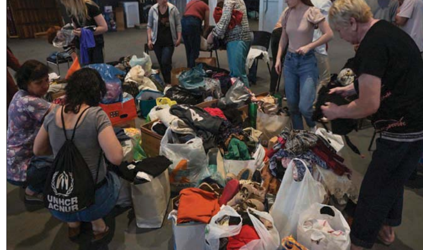
أوكرانيون في البرازيل يتلقون مساعدات في مراكز تديرها الكنائس (أفب)

عنها «رويترز»، إن لدى بعثتها تقارير عن أكثر من 300 عملية قتل غير مشروعة في مناطق سكنية شمال كييف من بينها بوتشا. وتوقعت أن يزيد العدد. وقابل المراقبون رجالاً عمره 70 عاماً اختبا أكثر من ثلاثة أسابيع في قبو كان مكتظاً، لدرجة أنه كان ينام وأفا بعد أن يربط نفسه في صارخ خشبي حتى لا يسقط بعدما يغفو. وعبرت بوجنر عن القلق أيضاً من استخدام الجانبين مدارس في أغراض عسكرية بل ونقل عتاد عسكري ثقيل إليها في بعض الحالات. وتتحرق البعثة أيضاً صحة «مزارع يمكن التحويل عليها»، بحسب وصف وصيد بعثتها، عن عمليات تعذيب وإساءة معاملة وإعدام ارتكبتها القوات الأوكرانية مع قوات الغزو الروسية والقوات المحلية المتحالفة معها. كما أعلنت المنظمة الدولية للهجرة والبنك الدولي واللجنة الدولية للصليب الأحمر أنها تشن حرباً عدوانية لا مبرر لها. وكانت بوجنر تتحدث بعد رحلة إلى أوكرانيا قامت بها في الأسبوع الماضي وزارت خلالها مناطق حول كييف وتشترهيف كانت القوات الروسية تحتلها في السابق. وقالت، كما اقتبست