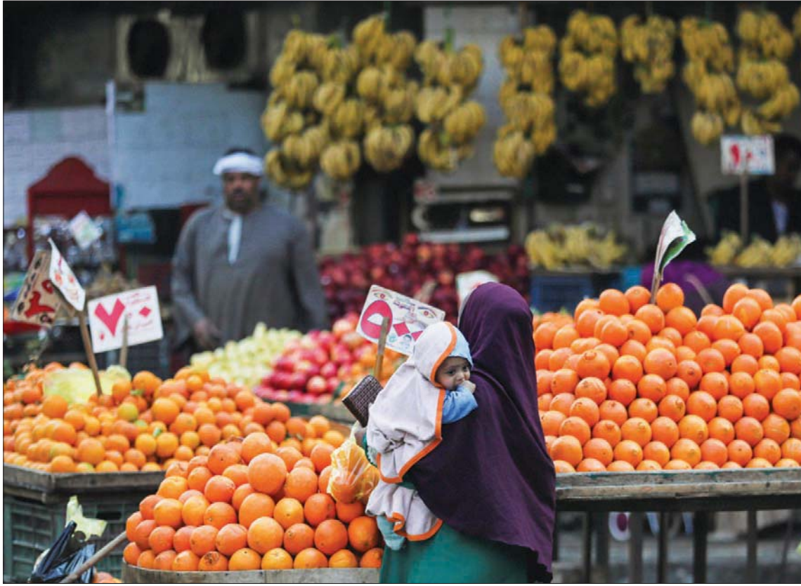
يزيد تسارع التضخم الضغط على البنك المركزي المصري لرفع أسعار الفائدة عندما يجتمع الأسبوع المقبل

العالم فضلا عن تراجع قيمة الجنيه خلال الفترة الماضية، انخفاضاً من تقدير للسنة المالية الحالية عند 6,2 في المائة. وتتوقع أن يتباطأ النمو الاقتصادي بشكل طفيف إلى 5,5 في المائة من 5,7 في المائة هذا العام وأن يظل معدل التضخم ثابتاً عند 9 في المائة.