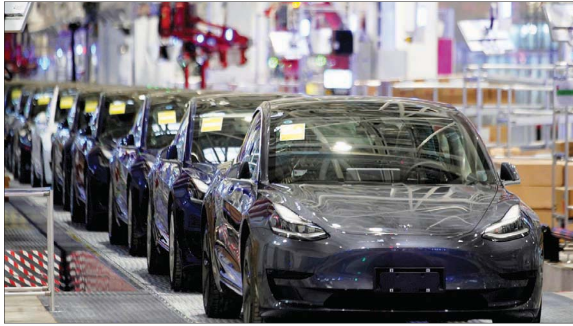
مصنع تسلا في شنغهاي

مليون نسمة، تعاني من سادس أسبوع من الإغلاق على مستوى المدينة. وتتزايد العزلة المطولة التي تُفرض بلا هوادة مع العالم الخارجي الذي يعود تدريجياً إلى أسلوب الحياة الذي كان عليه قبل (كوفيد)، حتى في حالة ظهور إصابات وتهدد الصين باتخاذ إجراءات