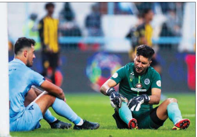
الباطن للموسم الثاني على التوالي وهو يصارع من أجل البقاء