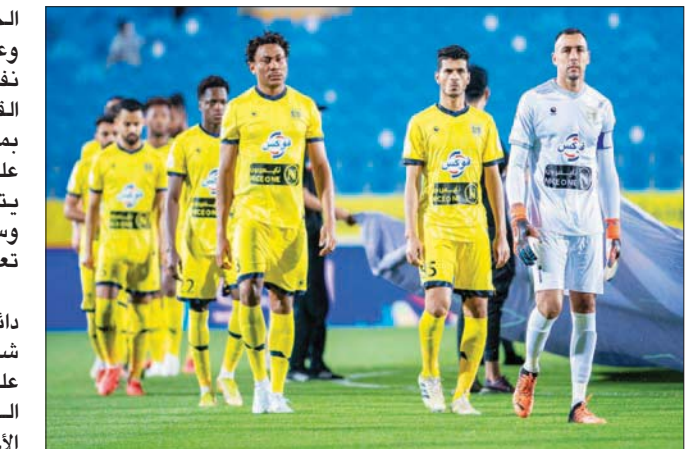
الاتحاد الأقر للبط