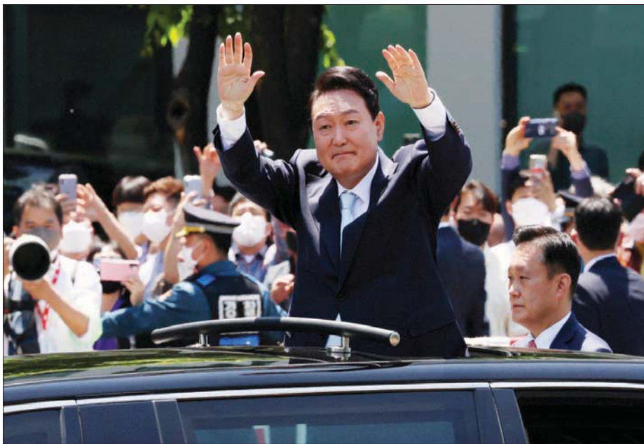
رئيس كوريا الجنوبية يون سوك يول يحيي مؤيديه عقب تنصيبه في الجمعية الوطنية بسيول أمس

مراسم التنصيب الرسمية في ساحة الجمعية الوطنية في سيول، وتخللها استعراض لجنود بالزي الرسمي و 21 طلقة مدفعية. حضر قرابة 40 ألف شخص مراسم التنصيب الرسمية التي اعتبرت تقارير محلية أنها الأكثر تكلفة من نوعها وقد بلغت كلفتها 3,3 مليار وون (2,6 مليون دولار). وكان من بين الحضور الرئيس السابق مون وسلفه الرئيسة السابقة بارك غويون - هي التي خرجت من السجن مؤخراً بعفو من مون. وأوفد الرئيس جو بايدن المتوقع أن يزور سيول في وقت لاحق هذا الشهر، وقد أقرها من ثمانية أشخاص على رأسهم دوغلاس إيملوف، زوج نانجته كامالا هاريس. كما أوفدت اليابان والصين ممثلين رفيعي المستوى، في وقت قال يون إنه يريد إصلاح العلاقات التي شهدت توتراً أحياناً مع قوى إقليمية. وقال وزير الخارجية الياباني يوشيماسا هياشي عقب المراسم: «في وقت يتعرض النظام الدولي القائم على القوانين للتهديد، تزداد الحاجة إلى التعاون الاستراتيجي بين اليابان وكوريا الجنوبية... أكثر من أي وقت مضى». وأضاف أن بلاده وجارتها كوريا الجنوبية اتفقتا على أن يتخليا عن تقليد استمر عقوداً. وأثارت تلك الخطوة المتسارعة والمكلفة استياء بين العامة، وقال مراقبون إنها غير ضرورية وتهدد أمن البلاد في وقت يتصاعد فيه التوتر مع الشمال. وقال يون إن قصر بلو هاوس، الواقع في المقر الذي كانت تستخدمه إدارة الاستعمار الياباني من 1910 لغاية 1945، هو «رمز للقوة الاستبدادية»، معتبراً أن نقل المقر سيضمن رئاسة أكثر ديمقراطية. وسيفتح حرم القصر حديقة عام، وخلال الإلقاء خطاب القسم بخت مشاهد حية أظهرت عدداً من الأشخاص يسرون باتجاه الجمع الذي كان محصناً ذات يوم، ونظمت