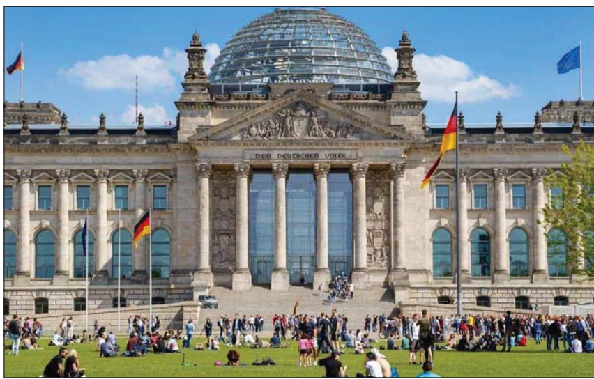
ارتفاع عدد الإقامات الفندقية للزوار الأجنبي في ألمانيا 5,254 ٪ إلى 3,3 مليون ليلة في مارس الماضي

الاثنين، إن حركة المسافرين تتعافى بشكل أسرع مما كان متوقعا، وأنه في المتوسط يمكن للقطاع الآن أن يشهد عودة أعداد المسافرين إلى مستويات ما قبل الوباء في عام 2023، أي قبل عام مما كان متوقعا في السابق.