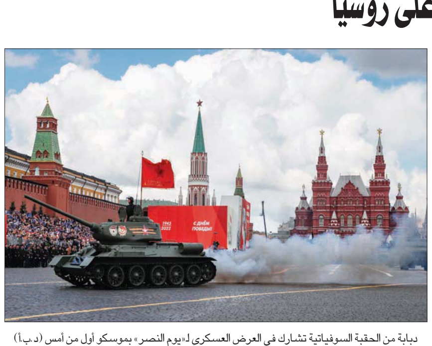
بداية من الحقة السوفياتية تشارك في العرض العسكري لـ «يوم النصر» بموسكو أول من أمس (دبأ)

اتخذتها الولايات المتحدة ودول الاتحاد الأوروبي. وقال كيشيدو: «لقد انتهكت روسيا مراراً القانون الإنساني الدولي بقتل المدنيين ومهاجمة محطات الطاقة النووية... هذه جرائم حرب لا تغتفر». وشملت العقوبات حظر على استيراد بعض السلع الروسية، وتجميد أصول بنك «سبيرديك» المملوك للدولة. يمثل هذا تغييراً في موقف اليابان التي قالت في وقت سابق إنها ستخفض الواردات تدريجياً، بينما تبحث عن موردين آخرين في أعقاب العقوبات المفروضة على روسيا بعد غزوها أوكرانيا في 24 فبراير (شباط). ووفقاً للبيانات الحكومية، شكّل الفحم الروسي 11 في المائة من إجمالي واردات اليابان من