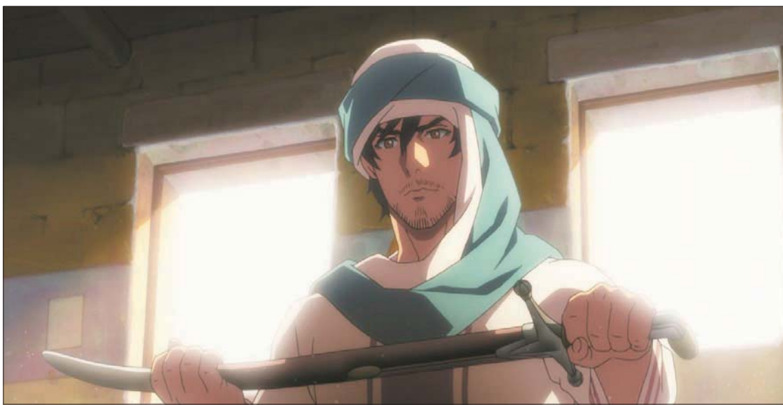
فيلم «الرحلة» يحكي قصة ملحمية بُنيت على التراث العربي

في المواهب السعودية والتي تسعى دوماً لتعزيزها في شركة «مانجا» للإنتاج عبر شركائنا الدولية المختلفة، وسنواصل بإذن الله مسيرة تصدير ثقافتنا وإبداعنا للعالم».