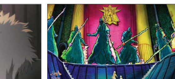
لقطة من فيلم «الرحلة»