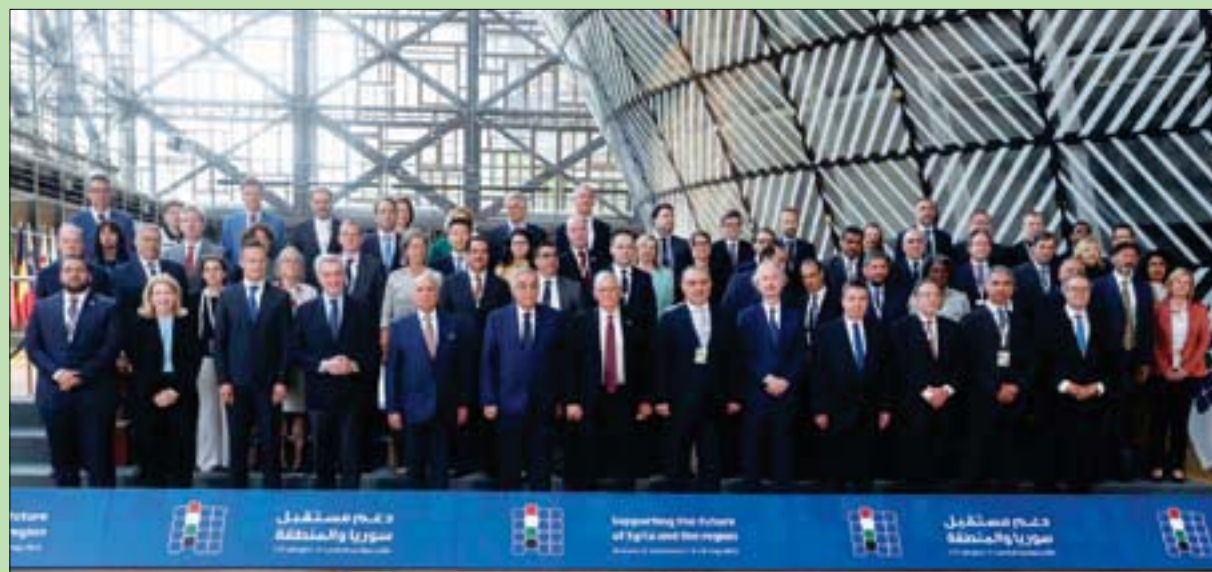
مسؤول السياسة الخارجية بالاتحاد الأوروبي جوزيب بوريل وغيره من المسؤولين الدوليين المشاركين في مؤتمر بروكسل لدعم مستقبل سوريا والمنطقة، أمس. وجمع المؤتمر السادس من نوعه 6,7 مليار دولار، وهو رقم أعلى بقليل من 6,1 مليار دولار الذي سعت الأمم المتحدة لجمعه (إ.ب). (تفاصيل ص 7)

«مؤتمر بروكسل، يجمع 6,7 مليار دولار سوريا