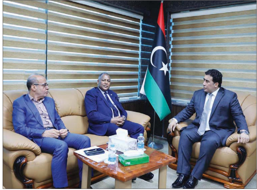
صورة ورعها المجلس الرئاسي واجتماع رئيسه محمد المنفي ونائبه مع وزير مالية حكومة الوحدة في طرابلس

أطلق فتحى باشاغا، رئيس الحكومة الليبية الجديدة المكلفة من مجلس النواب، أمس، مبادرة تهدف لتوسيع رقعة التواصل والمشاركة مع الجميع، والتوافق حول القيم المؤدية للانتخابات. وفي غضون ذلك قرر البرلمان، أمس، بعد تصويت اعضائه بالموافقة على أن تبدأ «حكومة الاستقرار»، التي يقودها هذا العام، العمل في مدينة سرت (وسط)، حسبما أفاد ناظر رسمي باسم البرلمان.