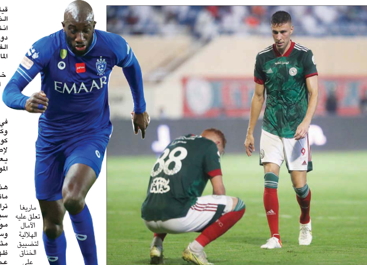
فريق الاتفاق سيكون في معضلة حين الخسارة أمام الهلال

خطر الهبوط المباشر إلى المركز الثالث عشر، وهو الأمر الذي يمنح الفريق فرصة متناهية للتعامل مع مبارياته القادمة دون ضغوط انتظار نتائج بقية الفرق.