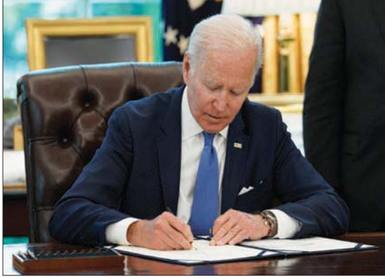
بايدن يوقع آلية من الحرب العالمية الثانية لإيصال المعونات لأوكرانيا

ويواجهون مقاومة شديدة من الأوكرانيين... وقال: «لدينا مؤشرات مختلفة يرفضون إطاعة الأوامر العسكرية»، وأشار إلى أن القوات الروسية تواصل قصف جنوب إيزوم والتقدم باتجاه ليغان، مؤكدا أن الأوكرانيين يحاولون دفع الروس باتجاه الشرق من خاركيف، ويأن ماريوبول وأوديسا تتعرضان للحصص أيضا... وأضاف أن الروس من مدن وبلدات، بشكل يومي أحيانا... وأكد أن عمليات كز وفر تحدث في عدة قرى وبلدات صغيرة في دونباس، بسبب عجز الروس عن اقتحام المدن الكبرى... لكنه أضاف أن الروس يحاولون إحراز تقدم تدريجي نزولا من الشمال ويدهون بقواتهم نحو دونباس خارج بلدة إيزوم... لكن تحركهم بطيء وغير منظم ويواجهون مقاومة أوكرانية صلبة وشديدة... وقال كيري: «ما زلنا نعتقد أنهم متأخرون عن جدولهم الخاص، ومن ثم فإن التقدم الذي يحرزونه محدود للغاية من حيث النطاق الجغرافي فقط... وكان مسؤول دفاعي أميركي، في ذلك أن الروس لم يحققوا الكثير من التقدم في الأيام الأخيرة في دونباس،