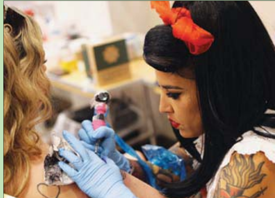
رسم وشم لإخفاء الندوب جراء عنف أو حريق