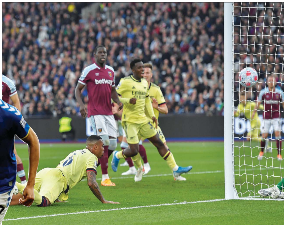
غابرييل على الأرض يسجل برأسه هدف الفوز لأرسنال في مرمى وستهام

مبارياته الخمس الأخيرة. وفغادي إيفرتون مباراة ثلاثة من دون فوز بعدما كان تعادل سلباً مع ليستر سيتي في 20 أبريل (نيسان)، وخسر في «ديربي ميرسيسايد». أمام ليفربول صفر - 2 في المرحلة الماضية. في المقابل، فشل تشيلسي في تحقيق الفوز للمباراة الثانية تواليًا، إذ كان تعادل مع مانشستر يونايتد في 1 - 1 في منتصف الأسبوع في مباراة مقده من المرحلة 37 بسبب انشغاله في نهائي الكأس ضد ليفربول في 14 مايو (أيار) على ملعب «ويمبلي». وبعد انتهاء الشوط الأول سلبياً بين الفريقين، مع نسبة استحواد أكثر لتشيلسي وفرصة خطيرة وحيدة لإيفرتون، نجح أصحاب الأرض في افتتاح التسجيل مع انطلاق الشوط الثاني بعد خطأ من قائد الفريق اللندني المدافع المخضرم الإسباني سيراز أزييليكويتا أمام منطقة الجزاء، ليقطع ديمراي غراي الكرة ويمررها لريشارليسون الذي سدده بمهارة على يسار الحارس مندي. وبدأ استعراض بيكفورد بعد تسديدة من مابسون ماونت أصابت القائم الأيمن ووصلت إلى أزييليكويتا المتربص عند القائم الأيسر ليسدد بينما صدها حارس إنجلترا الدولي باعجوبة، وأخري بوجهه، قبل أن يصد بقضيته تسديدة بعيدة من 25 مترًا لروين لوفتوس - تشيك وتسديدة من داخل المنطقة من البديل المغربي حكيم زياش ليغني على انتصار فريقي.