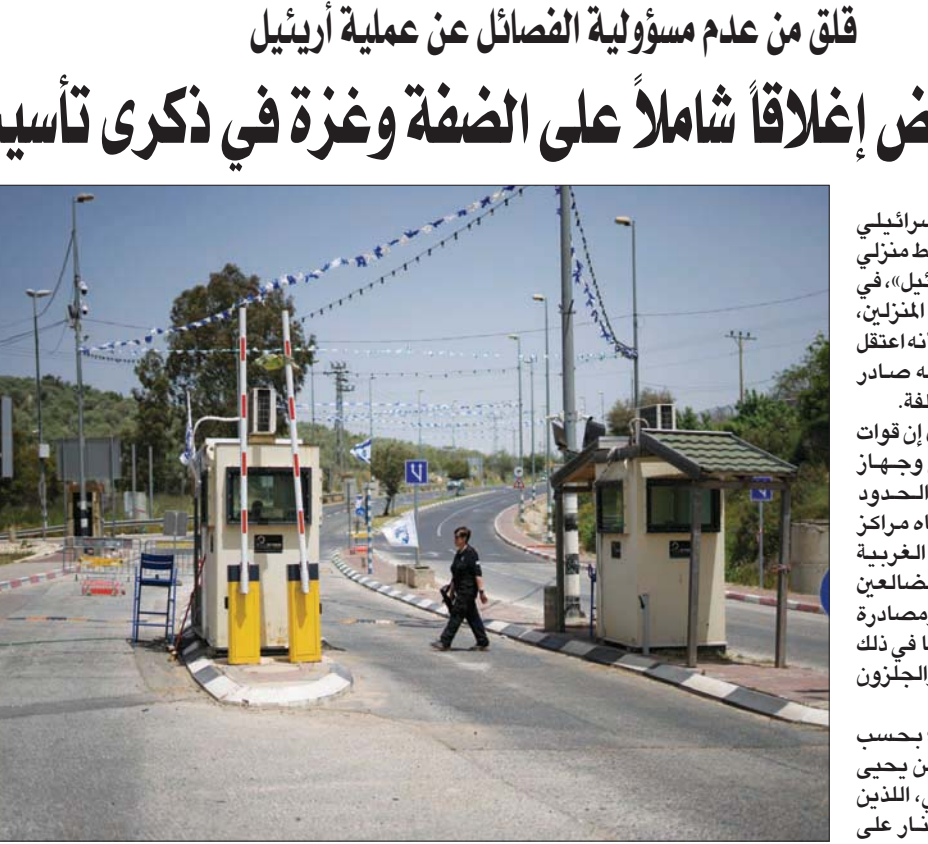
حارس إسرائيلي يؤمّن مدخل مستوطنة «ريئيل» في الضفة بالقرب من نابلس السبت

المستوطنين على المواطنين في البلدات والقرى الفلسطينية، وحملت الحكومة الإسرائيلية برئاسة نفتالي بنيت، المسؤولية الكاملة والمباشرة عن هذه العقوبات الجماعية، وعدتها كمن يصب الزيت على النار، وأنها سبب رئيسي لاستمرار التصعيد الإسرائيلي وخلق مزيد من الانفجارات في ساحة الصراع. النشاط الموسع لاعتقال ناشطين فلسطينيين جرى على خلفية أن الفصائل الفلسطينية لم تقف خلف العملية الأخيرة التي قبلها، وإنما جرى تنفيذها بشكل فردي، وهو نوع من العمليات التي تؤرق إسرائيل؛ لأنها لا تستطيع التنبؤ بمثل هذا النوع من العمليات. وأكد المتحدث باسم الجيش الإسرائيلي، ران كوخاف، للإذاعة العامة الإسرائيلية «كان»، أمس، أن «العمليات التي نُفذت منذ (عملية) بئر السبع، ليست بنوعية من (حماس) أو تنظيم آخر... وهذا يصنع تحدياً كبيراً وتخييراً من المصائب»، وكان الجيش قد اعتقل في وقت متأخر، السبت، منفذاً عملية إطلاق النار في مستوطنة «ريئيل»، وقالت وسائل إعلام إسرائيلية وفلسطينية، في حينه، إنهما ينتميان إلى قوات الاحتلال وميليشيات