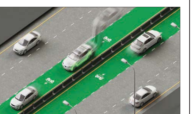
دراسة الفريوق: ويَجُمَل كشك

وجدير بالذكر أن كثير من العوامل تلعب دوراً عند إضافة الطرق المزودة بأنظمة الشحن اللاسلكي إلى شبكة الطرق الحضرية، فقد يبحث السائقون عن طرق للشحن في تنقلاتهم، وهو أمر نتج عنه آثار على عملية التخطيط الحضري والتحكم في حركة المرور. وفي الوقت نفسه، فإن كثافة تجهيزات وتركيب أجهزة الشحن في طرق المدن، والوقت المحتمل الذي يقضيه الركاب على تلك الطرق وفيما بينها، قد نتج عنه آثار على حجم