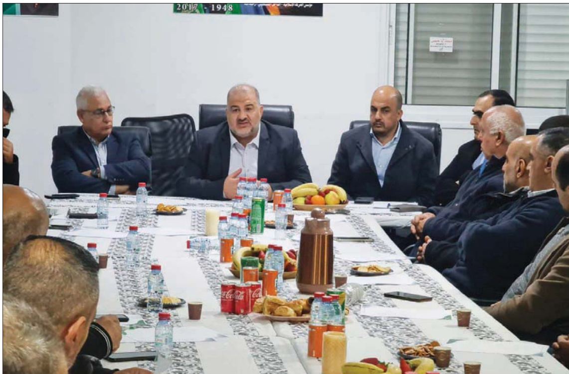
صورة على حساب القائمة العربية الموحدة (الإسلامية) في فيسبوك لإفطار رمضان بحضور منصور عباس

وكلّ مزايده على مواقفها، لا سيما تلك المتعلقة بالقدس والأقصى. وتؤكد أن أبناء الحركة الإسلامية هم أكثر من يُترجمون حبّ الأقصى وأقداً وعملاً، فقد جُعدت الموحدة عضوية نوابها في البرلمان نتيجة الأحداث الأخيرة بحق القدس والأقصى، في خطوة توقوف الأحداث في القدس والإنتهكات في الأقصى، ووضعت موقفاً ومطلباً واضحاً في كلٍّ من الأقصى والمسجد الأقصى المبارك، ومبدأياً، واصلت الحركة الإسلامية مشروعها بتسيير آلاف الحافلات للمسجد الأقصى، وإقامة العديد من المشاريع في القدس والأقصى، ومنها مشاريع رباط وتمكين والحفاظ على الأوقاف والمقسات». وشددت الموحدة على «أن تبقى بولصتها موجّهة نحو تحقيق مصالح المجتمع العربي الفلسطيني في الداخل»، وأنها لن تسمح لأصوات غربية أن تحرف القائمة عن بولصتها. مضيفة: «اختارنا أبناء مجتمعنا لتمثّل قضاياهم وتؤثّر من أجل حلّها، إن كان ذلك في ملفّ العنف والجريمة أو القرى غير المعترف بها، وغيرها أزمة الأرض والسكن، وغيرها من القضايا التي ينفذ بسببها أبناء هذا المجتمع صباحاً ومساءً، والتي نقلها نواب الموحدة إلى دائرة التأثير، وهي دائرة التأثير نفسها التي اختارتها الموحدة