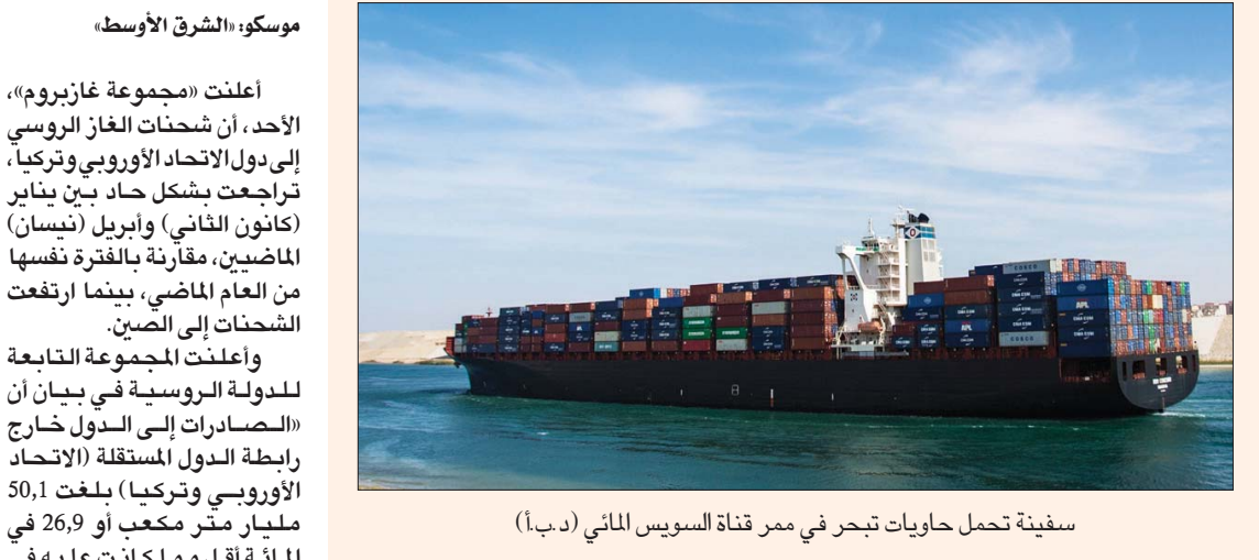
سفينة تحمل حاويات بحر في ممر قناة السويس المائي (د.ب.أ)

تحت الأرض في أوروبا تمثل تحدياً جدياً للغاية»، وأوضح التضارب الأوروبي في فرض عقوبات على قطاع الطاقة الروسي، كان آخره من الجمر التي أكدت معارضتها قيام الاتحاد الأوروبي بتوسيع العقوبات ضد روسيا لتشمل قطاع الطاقة، وحذر أحد وزرائها من أن مثل هذه الخطوة ستلحق ضرراً بالدول الأعضاء في التكتل أكثر من موسكو. ومن المقرر، وفق «بلومبرغ»، أن يقدم الاتحاد مقترحاً لفرض حظر على النفط الروسي بحلول نهاية العام على خلفية الغزو الروسي لأوكرانيا، على أن يتم البدء في فرض قيود على الواردات تدريجياً حتى ذلك الحين، ونقلت موسكو، «الشرق الأوسط» أعلنت «مجموعة غازبروم»، الأحد، أن شحنات الغاز الروسي إلى دول الاتحاد الأوروبي وتركيا، تراجعت بشكل حاد بين يناير (كانون الثاني) وأبريل (نيسان) الماضيين، مقارنة بالفترة نفسها من العام الماضي، بينما ارتفعت الشحنات إلى الصين. وأعلنت المجموعة التابعة للدولة الروسية في بيان أن «الصادرات إلى الدول خارج رابطة الدول المستقلة (الاتحاد الأوروبي وتركيا) بلغت 50,1 مليار متر مكعب أو 26,9 في المائة أقل مما كانت عليه في الفترة نفسها من عام 2021»، وقالت «غازبروم» إنها ستواصل توريد الغاز «مع الامتثال الكامل للتزامات التعاقدية». ووفق البيان، زادت الصادرات إلى الصين بنسبة 60 في المائة خلال عام غير خط أنابيب «باور أوف سيبيريا». كما ذكرت «غازبروم» أن احتياطي الغاز في منشآت التخزين تحت الأرض الأوروبية بلغت 6,9 مليارات متر مكعب. وقالت «غازبروم»: «التحقيق هدف مئة منشآت التخزين بنسبة 90 في المائة لحدود الاتحاد الأوروبي، فستعين على الشركات ضخ 56 مليار متر مكعب إضافي من الغاز». وأكدت المجموعة على إعادة تكوين احتياطي الغاز في