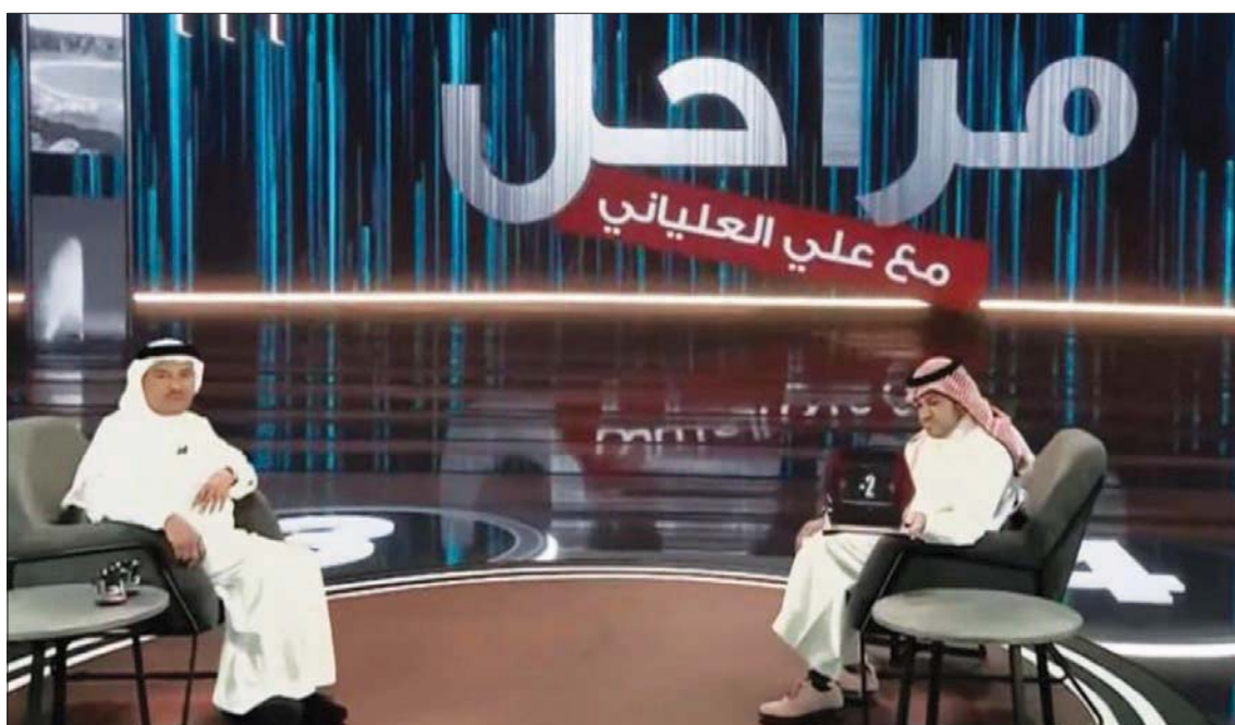
جدة، «الشرق الأوسط»

قدم فنان العرب محمد عبده اعتذاره لأسرة وجهوه ومحبتي الراحلين أبو بكر سالم يلقيه، وطلال مداح، على خلفية تصريحات أطلقها خلال ظهوره على التلفزيون السعودي، الذي استضافه مساء الثلاثاء الماضي.