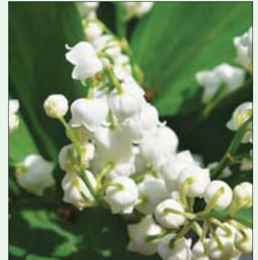
زهرة عيد العمال