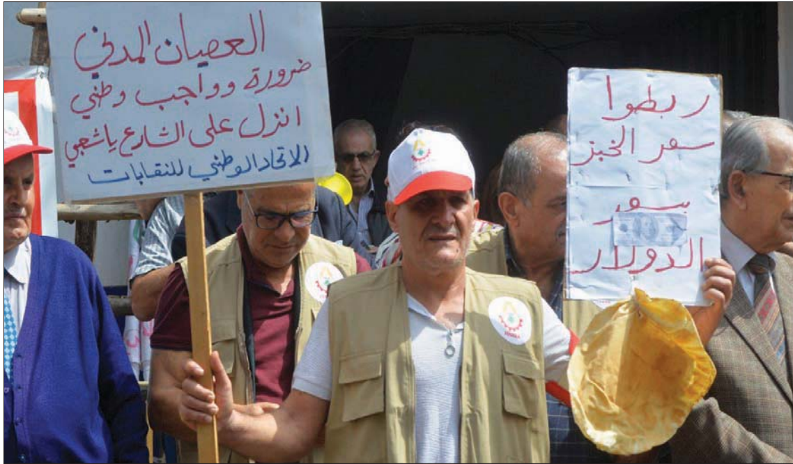
مشارك في مظاهرة لـالاتحاد الوطني لنقابات العمال» في بيروت أمس بمناسبة عيد العمال

نجحت بعض القوى السياسية في لبنان، بتطيير قانون تقييد وتنظيم التحويلات والسحوبات المالية المعروف بـ«الكابيتال كونترول» لأسباب شعبية وانتخابية، كي لا تدفع ثمنها في صناديق الاقتراع، إلا أن هذه المغامرة بدأت تهدد خطة التعافي الاقتصادي والمالي، وتدفع باتجاه تطيير الاتفاق مع صندوق النقد الدولي، باعتبار أن «الكابيتال كونترول» يمثل شرطاً أول للصندوق، كي لا تذهب أمواله المرسودة للبنان أو بعضها إلى حسابات السياسيين في الخارج. وإذا كانت ظروف التفاوض مع صندوق النقد، متاحة في هذه المرحلة، فقد تكون معقدة أو شبه مستحيلة في مرحلة ما بعد الانتخابات البرلمانية المقررة في 15 مايو (أيار) المقبل، بالنظر لصعوبة تشكيل حكومة جديدة تستأنف عملية التفاوض، لكنّ النائب علي درويش دعا إلى استحقاق «الوسط المستقل» التي يرأسها رئيس الحكومة نجيب ميقاتي، قائلً من خطورة تطيير قانون