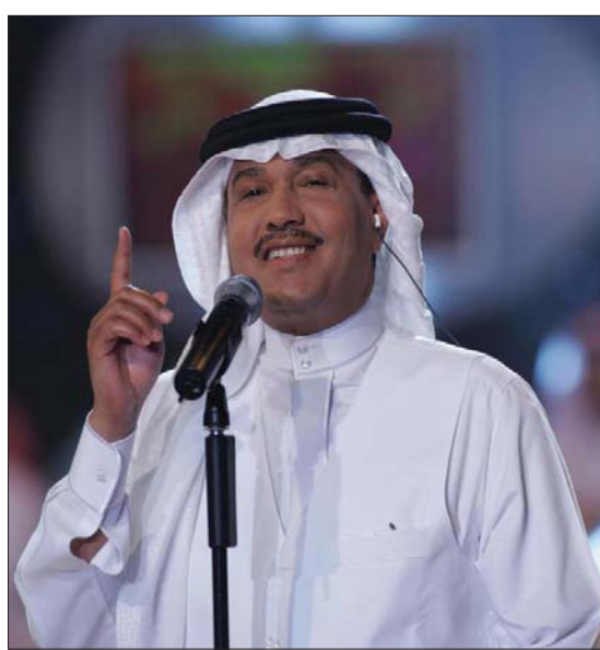
الفنان محمد عبده

وطني يذكر خلال مسيرتهما الفنية، ولم يكتب بذلك بل اعتبر أن لحن أغنية «وطني الحبيب» الأشهر لطلال مداح «مسروق»، وأن كلمات أغنية «يا بلادي واصلي» لسالم «لا