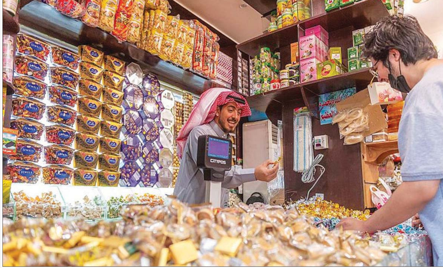
زيادة الإنفاق على الهدايا والحلويات خلال رمضان وعيد الفطر المبارك في السعودية (الشرق الأوسط)

لا يزال أمام المسوقين فرصة لاستثمار عيد الفطر المبارك على المستوى العالمي، وهي فرصة يمكن من خلالها نقل الصورة الثقافية لاحتفالات المسلمين في العيد، وجعل هذا الموسم موسماً تجارياً عالمياً كما هو الحال مع المواسم الأخرى. وفي ذلك التسويق فرص ابتكارية كثيرة يمكنها تنشيط المنتجات والخدمات الوطنية، والتسويق للسياحة المحلية. تقبل الله منا ومنكم صالح الأعمال، وأحاطكم بأهليكم وأحبائكم، وجعل عيدكم سعيداً، مليئاً بالفرح والوصول والتراحم، وكل عام وأنتم بخير وصحة وسعادة.