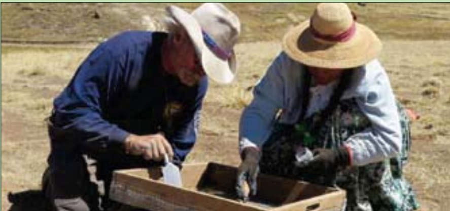
عملية تققيب عن النقوش الموجودة على لوحة حجرية

بندهش الفارئ عندما يجد أن أدوار الرجال والنساء لم تكن واضحة تماماً، وأن التعاون بين جميع