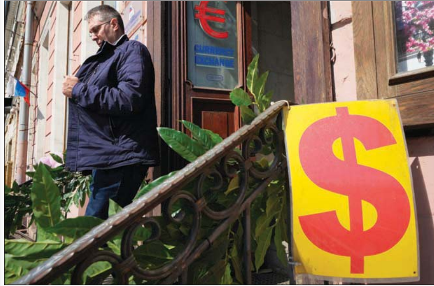
شركة صرافة في مدينة سان بطرسبرغ الروسية

تنمية روسيا لكن الغرب بدأ أنه يريد أن يقوم بحبس «بسرقتها». وكتب فولودين، الذي عادة ما يعبر عن آراء الكرملين، على قناته على تلغرام «من الصواب اتخاذ إجراءات مماثلة حيال الأعمال في روسيا التي يأتي من يملكونها من دول غير صديقة اتخذت فيها مثل تلك الإجراءات، صادروا تلك الأصول».