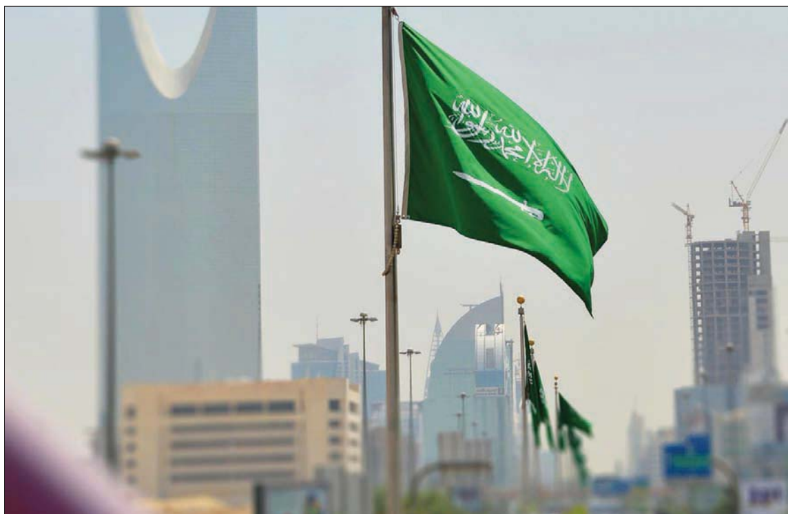
تصاعد النشاط النفطي يدفع بالاقتصاد السعودي إلى النمو بوتيرة متسارعة