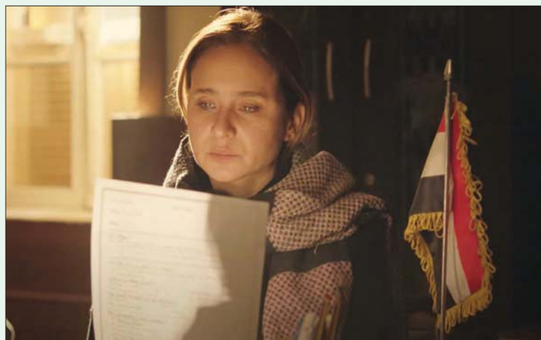
نيللي كريم في إحدى لقطات مسلسل «فانت أمل حربي»