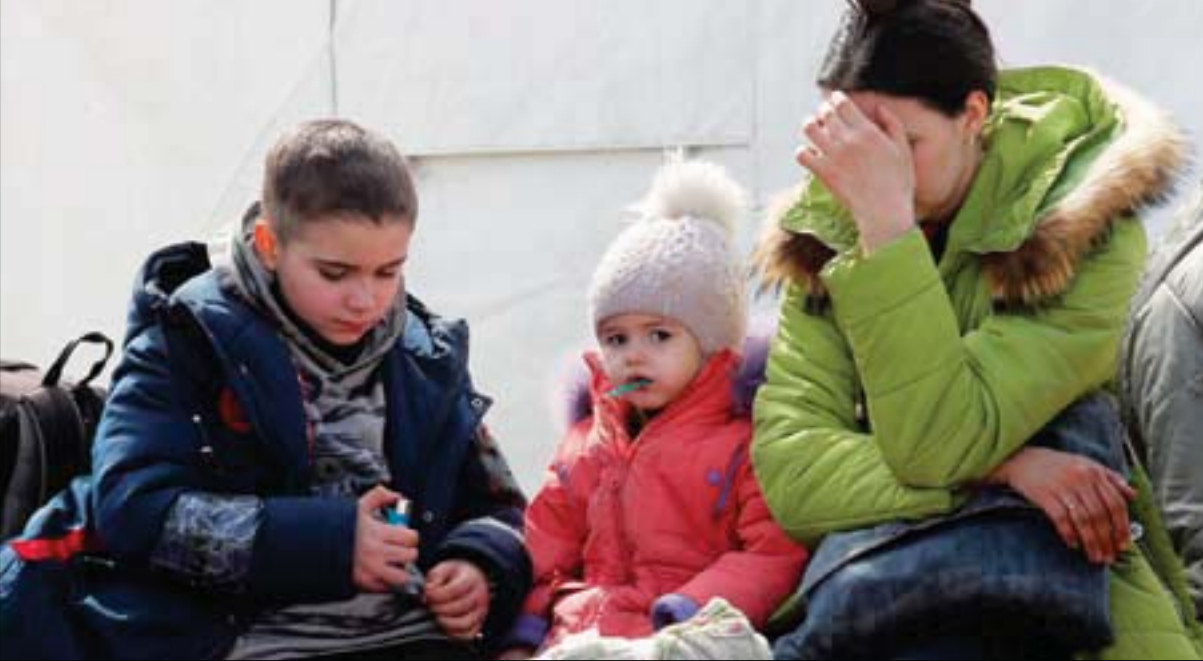
أوكرانية وطفلاً يصلون إلى قرية ييزيمين بعد إجلائهم من ماريوبول أمس

واشنطن: هبة القدسي كييفف - لندن: «الشرق الأوسط»