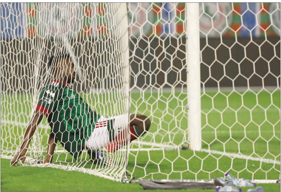
الاتفاق بات من أكثر الفرق المهددة بالهبوط إلى دوري الأولى

ولكنه رضي بذلك وقيل بالخطأ، ومع كل ذلك يجب أن يقف الجميع مع الكيان وليس الأشخاص؛ لأن الأشخاص يذهبون ويأتي غيرهم». وشدد على أن الفريق يحتاج إلى عمل كبير جدا من أجل الخروج من وضعه الراهن، حيث إنه يعد من أقل الفرق فنيا وليس قادرا على التفوق حتى على أقرب الفرق التي تنافسه للهروب من خطر الهبوط، متمنيا أن تكون للاعبين كلمة في مباريات الحسم، وأن يقدموا كل ما يستطيعون من أجل إنقاذ الاتفاق من الهبوط.