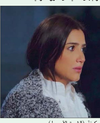
روبي وهي عمر في «رائيا وسكينة»