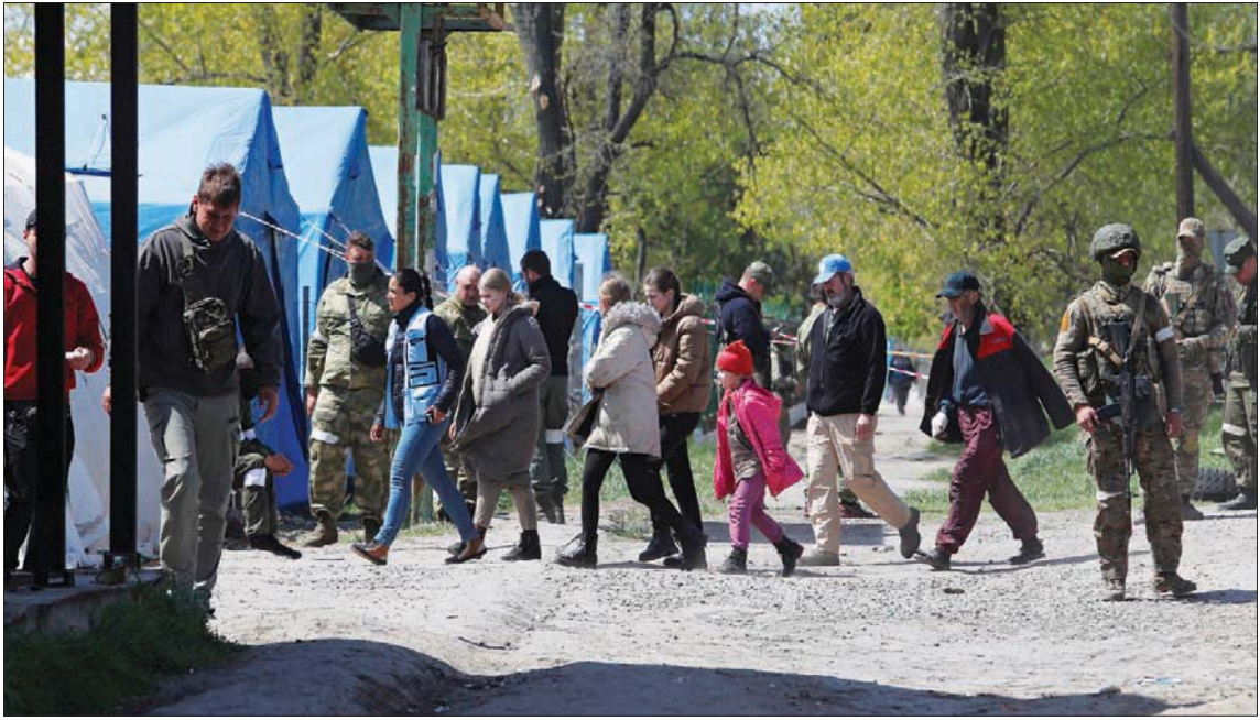
مندنيون غادروا مصنع آزوفستال في ماريوبول يصلون إلى قرية بيزيمين أمس (رويترز)

في المقابل، أبدى عمدة خيرسون إيهور كوليشيف، الذي أطاحت به السلطات الروسية، دهشته حيال إمكانية تنفيذ ذلك، بينما النظام المصرفي الوحيد الذي يعمل في المدينة لا يزال أوكرانيا. في سياق متصل، نقلت وكالة الإعلام الروسية أمس عن وزارة الدفاع الروسية اتهامها للقوات الأوكرانية بقتل مدربي مدرسة ودار حضانية ومقبرة في قري بمنطقة خيرسون الجنوبية. وأضافت الوزارة أن مدينتين سقطوا بين قتل وجريح، دون أن تذكر مزيداً من التفاصيل، ولم يصرر من أوكرانيا حتى وقت نشر هذا التقرير.