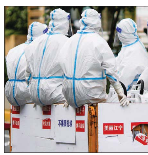
عمال يرتدون بدلات واقية في عربة أثناء تنقلهم وسط الإغلاق داخل شغهاي أمس

استقلال للبلاد، إن «الدول في جميع أنحاء العالم رفعت القيود للتعايش مع الفيروس»، مؤكداً أن «تايوان ستواصل (...) التوجه نحو (القدرة على العيش بشكل طبيعي) والدخول تدريجياً في مرحلة جديدة من الوفاة من الوبئة».