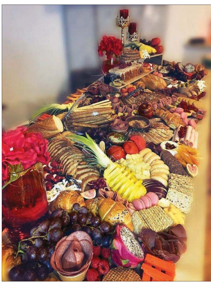
تعتيمة حجازية لإفطار العيد بطريقة عصرية

ويشرح فاضل أحد الأشخاص الذين يقدمون «التعتيمة الحجازية» بطريقة مبتكرة، ويضيف إليها «المقلقل، والمنزلة (ايدام طحينية)، وكتاب