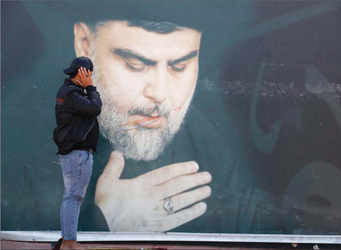
أحد أتباع الصدر في بغداد يصلي أمام ملصق لزعيم التيار الصدري في مارس الماضي

توشك مهلة زعيم التيار الصدري، مقتدى الصدر، التي منحها لخصومه في الإطار التنسيقي الشيعي، على الانتهاء. فبعد عطلة العيد التي بدأت في العراق من أمس (الأحد) وتنتهي في الثامن من مايو (أيار) الحالي، تتربص الأوساط السياسية ما سوف يصدر عن الصدر من موقف حيال ملف تشكيل الحكومة الذي تأخر كثيراً، والذي تم سببه خرق كل المدد الدستورية اللازمة، وبينما يبقى موقف الصدر الذي ينتظره الجميع، وليس بوسع أحد توقعه حتى أقرب المقربين إليه، هو الفيصل إلى حد كبير، فإنه وطبقاً لما صدر عن قياديين في الحزب الديمقراطي الكردستاني، فإن زعيم الحزب مسعود بارزاني سوف يقوم بإطلاق مبادرة بعد العيد تستهدف المساهمة في فتح الإنسداد السياسي. وبينما أصدر الإطار التنسيقي، وهو الخصم الشيعي الرئيس للحزب، ولتحالفه الثلاثي الذي يضم الحزب الديمقراطي الكردستاني وتحالف السيادة السني، فإن الصدر لم يتعامل مع أي مبادرات أو أفكار صدرت عن الإطار التنسيقي طوال الشهر الماضي من منطلق أن مهلة الصدر كانت تهدف إلى منحهم فرصة لتشكيل الحكومة.