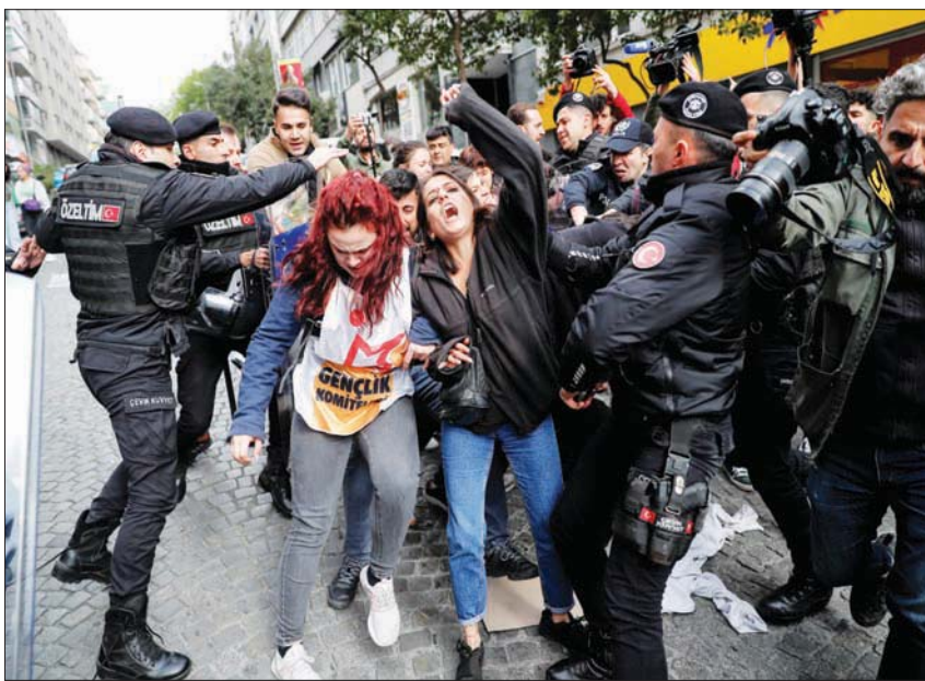
الشرطة تصدّت لمظاهرين أرادوا الاحتفال بـ«عيد العمال» في «ميدان تقسيم» بإسطنبول أمس (رويترز)

وتعود بداية الاحتفال بعيد العمال في تركيا إلى عام 1911 في عهد الدولة العثمانية، وأول مدينة شهدت الاحتفالات بعيد العمال هي مدينة سالونيك وكانت مدينة متطورة من ناحية المنظمات العمالية، وبدأت إسطنبول الاحتفال بعيد العمال في عام 1912 وتم اعتماد الأول من مايو عيداً للعمال بشكل قانوني في تركيا في عام 1923 مع إعلان الجمهورية. وبعد هذا التاريخ، أصدرت تركيا قانوناً أطلق عليه «قانون التضامن»، قال فيها إن تركيا تنمو بجهود عمالها، وهي تسير نحو أهداف جديدة دون أن تتعاطأ بفضل قوة وبراعة عمالها... دائماً كتف بكتف نحو أهداف أكبر». ونشر زعيم المعارضة التركية، كمال كليتشدار أوغلو، رسالة للعمال عبر «تويتر» انتقد فيها حكومة الرئيس رجب طيب أردوغان بسبب الوضع الاجتماعي والاقتصادي المتدهور في البلاد، قائلاً: «نحن في حالة تدهور اجتماعي واقتصادي خطير... سنبنى تركيا معاً، وسنحتفل في الأول من مايو بحماس في الساحات... بسبب الموظفين غير