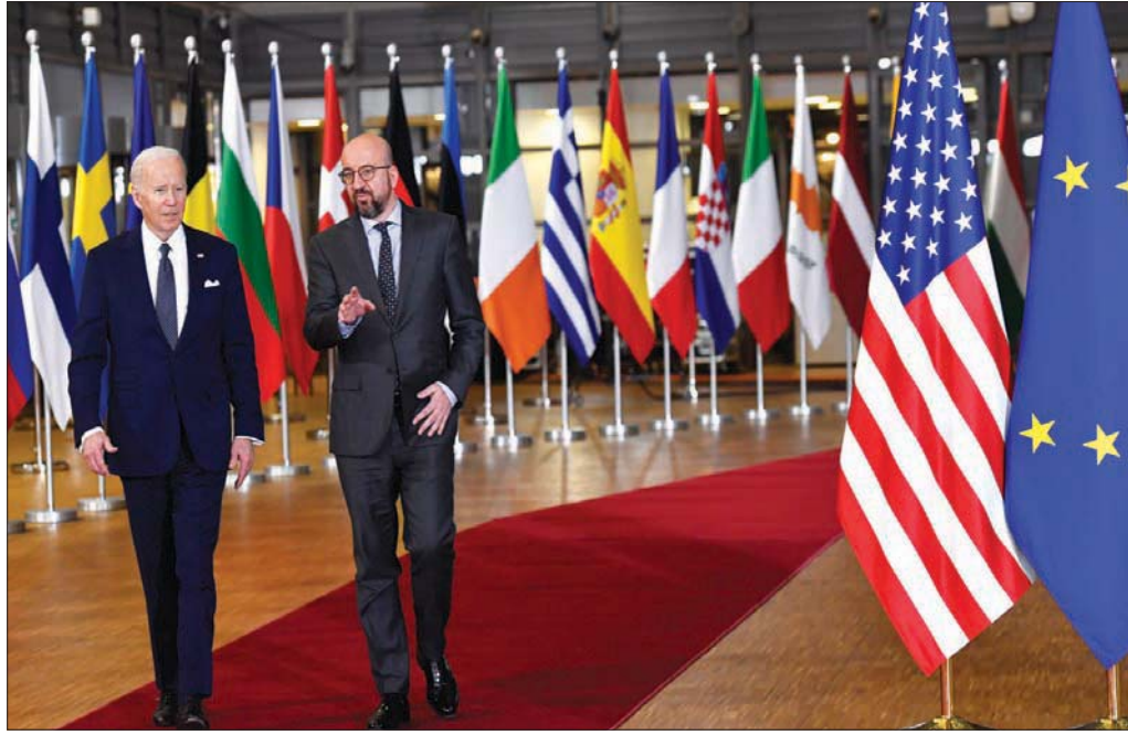
رئيس المجلس الأوروبي برفقة الرئيس الأميركي بيبوكسل في مارس الماضي

على الأمد الطويل، يخبر القلق عند بعض المحللين، مثل مايكل أوهانلون، مدير بحوث السياسات الخارجية في معهد «بروكينغز» والخبير المعروف في الأمن القومي الأميركي، الذي يقول إنه «من الخطأ تحويل إضعاف روسيا إلى الهدف الرئيسي من التدخل الأميركي. يجب أن نتحاشى تحويل روسيا إلى قوة محبطة وخطرة كما حصل لألمانيا في عشرينات القرن الماضي، ولا حاجة إلى التذكير بما حصل منذ مائة عام بعد تلك المذلة التي تعرضت لها ألمانيا». ويدعو أوهانلون إلى الاستمرار في توجيه رسائل إلى موسكو بأن ثقة مخرجاً دائماً عبر الحوار، مهما كان كل طرف متيقناً من احتمالات النصر، «لأنه إذا كانت الرسالة الوحيدة التي تصل إلى الكرملين هي أن واشنطن جاهزة لحرب طويلة، من المحتمل جداً أن تلجأ موسكو إلى خطوات تصعيدية يستحيل التكهّن بعدها وطبيعتها».