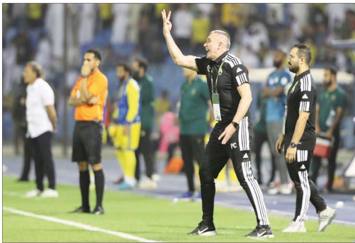
كارتيرون تسلم المهمة في وقت حساس من الموسم