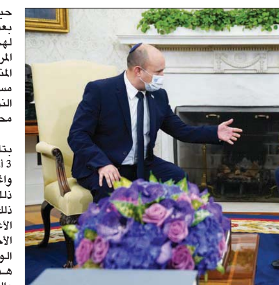
الرئيس الأميركي يتحدث إلى رئيس الوزراء الإسرائيلي في البيت الأبيض أغسطس 2021

حيث انتقد المنظومة الأمنية في البلاد بعد أيام قليلة من تعرض منشأة نظنز لمهجوم أدى إلى تعطيل أجهزة الطرد المركزي، وذلك بعد هجوم تعرضت له المنشأة في يونيو 2020، قبل اغتيال مسؤول الجوانب العسكرية في الملف النووي، ونائب وزير الدفاع السابق، محسن فخري زاده.