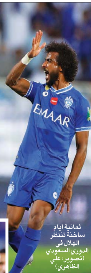
ثمانية أيام ساخنة تنتظر الهلال في الدوري السعودي

وفي حال تعثر الاتحاد الذي سيفتتح مبارياته بعد استئناف مسابقة الدوري السعودي للمحترفين أمام الفتح وانتصار الهلال في