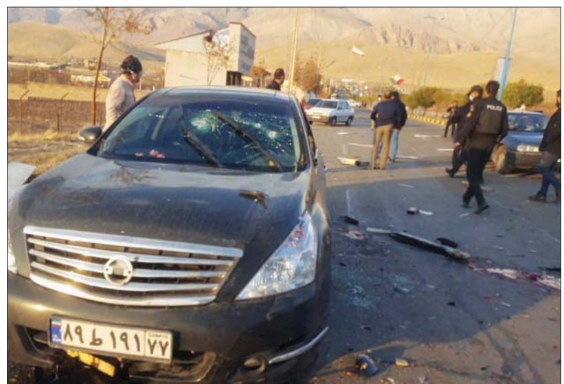
سيارة فخري زاده بعد لحظات من اغتياله في شرق طهران نوفمبر 2020

يأتي تسريب المعلومات بعد أيام من مشاورات ركزت على إيران، بين مستشار الأمن القومي الإسرائيلي أyal جولان والنظير الأميركي جيد سوليفان، في واشنطن. وكان مسؤول إسرائيلي أممي كبير قد كشف أمام قاعة التلفزيون الرسمي في إسرائيل «كان 11» وقناة «إيران إنترناشيونال» الناطقة بالفارسية، أن فرقة تضم رجلاً من «الموساد» والشاباك» الإسرائيليين، قاموا قبل عدة شهور بدخول الأراضي الإيرانية ومداومة رسولي، الضابط في الوحدة 860 في «فيلق القدس» الزراع الخارجية لـ«الحرس الثوري» الإيراني، وقاموا باحتجازه والتحقيق معه وتصوير اعترافاته بشرط فيديو. وتكثافات على «المعلومات الهيبة» التي أدلى بها، تقرر إطلاق سراحه. وقد رفض المسؤول الإسرائيلي الدخول في أي تفاصيل حول كيفية