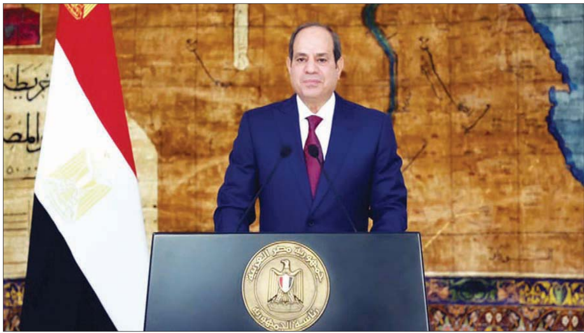
الرئيس المصري عبد الفتاح السيسي في كلمته أمس خلال الاحتفال بعيد العمال

تحت مظلة مبادرة (حياة كريمة)، وذلك لتحسين مستوى الخدمات اليومية المقدمة للمواطنين وتوفير فرص العمل بالمشروعات الصغيرة والمتوسطة. وأوضح أنه وجه الحكومة بسرعة الانتهاء من الاستراتيجية الوطنية للتشغيل، التي تهدف إلى توفير فرص عمل جديدة للشباب، وتحقيق نمو في الوظائف يتماشى مع النمو الاقتصادي، وقال إنها «استراتيجية ستؤامع، مع الواقع الجديد لسوق العمل وتتواءم مع المتغيرات الاقتصادية المفاجئة، والتحول التكنولوجية الحديثة، والتعامل بفاعلية مع وظائف عمال المصانع وأكد أن «مصر أولت اهتماماً خاصاً بزيادة الحد الأدنى للأجور للمعاملين بأجهزة الدولة وهيئاتها العامة الاقتصادية والخدمية، وعلى الوزاري، حيث انتهى المجلس القومي للأجور إلى التوافق على تحديد الحد الأدنى للأجور، للمعاملين بالقطاع الخاص لأول مرة في مصر منذ العديد من السنوات». وحول تمكن المرأة، قال السيسي إن ذلك يعمل على زيادة الدخل القومي ويضاعف معدلات التنمية لذلك، مشيراً إلى أن الدولة قامت بكثير من الإصلاحات الخاصة بالمرأة العاملة، مؤكداً ضرورة وضع إطار دائم لتمكين المرأة في سوق العمل ومساندتها للالتحاق بوظائف المستقبل وحمايتها في أماكن العمل.