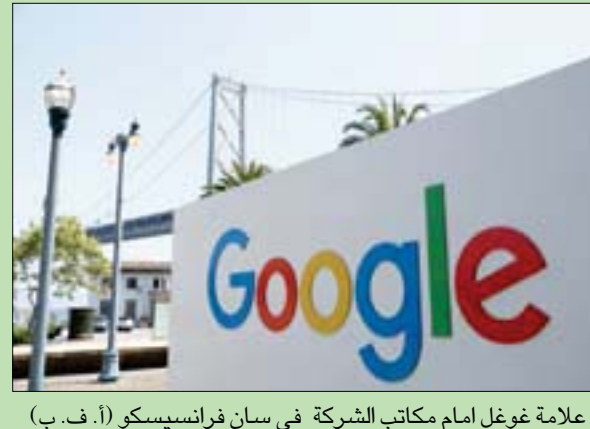
علامة غوغل أمام مكاتب الشركة في سان فرانسيسكو (أ. ف. ب)

حين تعتمز شركة «غوغل» توفيرها أيضاً على خدمة محرك البحث في المستقبل، حسب ما أكدته متحدثة باسمها. كانت «غوغل» قد أعلنت في ديسمبر (كانون الأول) الماضي اعتزامها توفير المزيد من أدوات التحكم في ظهور الإعلانات أمام المستخدمين، لأن بعض الناس قالوا إنهم يريدون تقليص الإغراءات التي يتعرضون لها من جانب موفري بعض المنتجات مثل الكحوليات والمراهنات. وهذه الخدمة الجديدة يمكن أن تكون مفيدة، بالنسبة للمتعافين من إدمان المخدرات، لأن الإعلانات ستحذف من إدمانهم