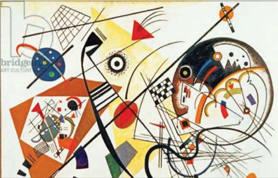
من أعمال كاندنسي

وقد قال كاندنسي في إحدى رسائله المعروضة: «شخصياً لا تحمليني الدهشة مطلقاً عندما يفسر أحد أشكالها التي يتجرد بها الشكل، بكونها عملية أنحلال وقسر». لقد كان هذا الفنان بكل أعماله الفنية التي سخر لها حياته يؤكد على مفاهيم السيطرة الروحية