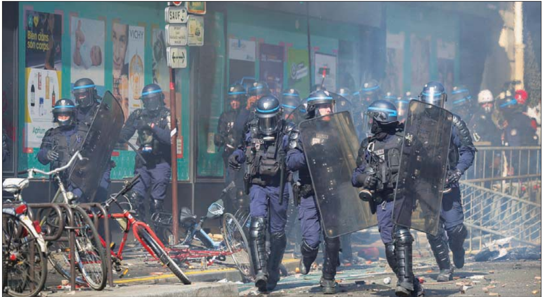
مواجهات بين الشرطة ومظاهرين بمناسبة عيد العمال في باريس أمس

هذا لم يتحقق حتى الآن. وتابع ميليشيون، قبل بدء المسيرة: «لن نقدم تنازلاً واحداً بشأن المعاشات». وخلافاً لما حدث في سنوات سابقة، لم تضع مارين لوين إكليلاً من الزهور في باريس عند تمثال رمزاً قومياً. وحل محلها رئيس التجمع الوطني المؤقت جوردان بارديلا، الذي قال إن لوين تستعد للانتخابات التشريعية. وحضت لوين الناخبين في رسالة مصورة على انتخاب أكبر عدد ممكن من النواب من حزبيها في يوينو، حتى يتسنى «حماية قوتك الشرائية» ومنع حشد ماكرون من القيام «بمشروع صاغر لفرنسا والشعب الفرنسي». وستجرى فرنسا الانتخابات البرلمانية يومي 12 و19 يونيو.