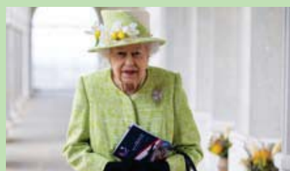
الملكة إليزابيث والاحتفال بالإنترنت الملكي

على الكتاب كتذكار بمناسبة اليوبيل البلاطيني للملكة إليزابيث. ويعرض الكتاب اقتباسات شهيرة من الملكة، إلى جانب تفاصيل حول حياة شخصيات بارزة في الكومنولث مثل رئيس جنوب أفريقيا السابق نيلسون مانديلا. وذكرت وزارة التعليم أنه سيتم توزيع الكتب على الأطفال في المدارس الابتدائية التي تمولها الدولة في جميع أنحاء المملكة المتحدة.