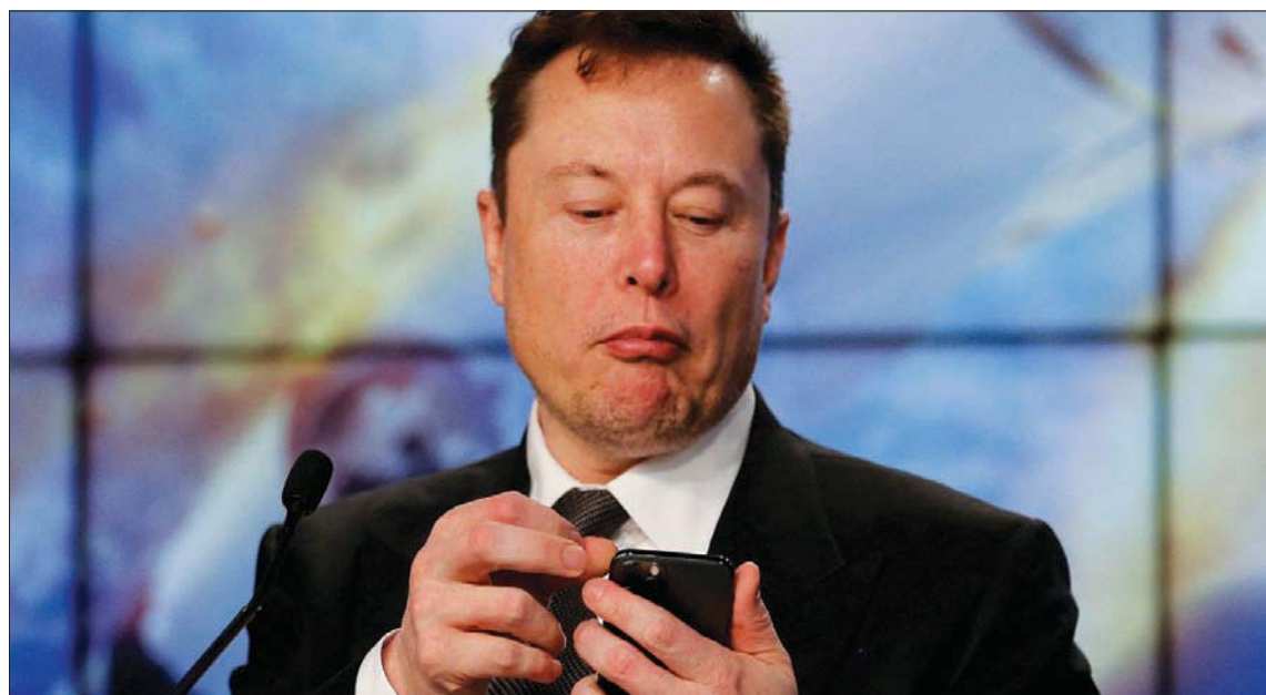
إيلون ماسك ينظر إلى هاتف الجوال في يناير 2020

يمكن أن يشكل تحدياً على العنف لدى آخرين.