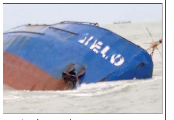
صورة للسفينة الغارقة في 17 أبريل الحالي

تونس، المنجي السعيداني تستعد تونس مجموعة من التحركات الاحتجاجية المناصرة للرئيس التونسي قيس سعيد وخصومه، خصوصاً «الحزب الدستوري الحر» الذي ذهب إلى حد الدعوة للزحف على قصر قرطاج منتصف شهر مايو (أيار) المقبل.