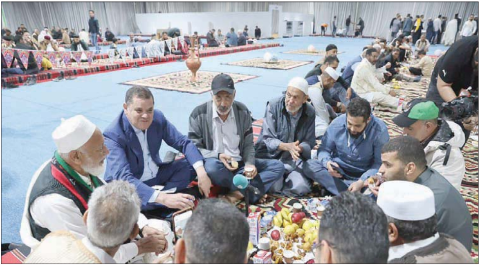
القاهرة، خالد محمود

سعى فتحي باشاغا، رئيس حكومة «الاستقرار» الليبية الجديدة، إلى الإحياء بحصوله على دعم من إدارة الرئيس الأميركي جو بايدن، تزامناً مع تأجيل زيارة غريمه عبد الحميد الدبيبة رئيس حكومة «الوحدة» المؤقتة، التي كانت مقررة إلى تونس من دون أي تفسير أو إعلان رسمي.