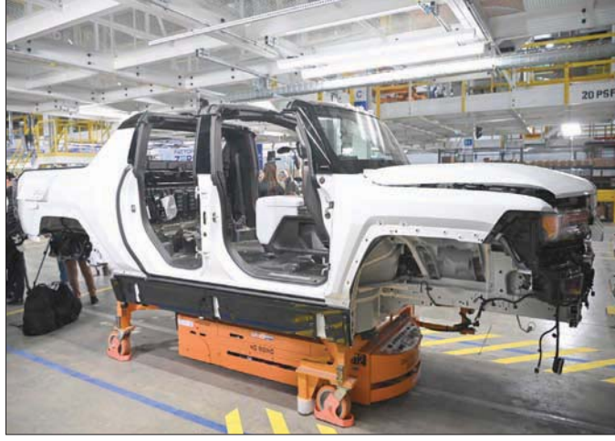
مصنع جنرال موتورز في ميشيغان بالولايات المتحدة