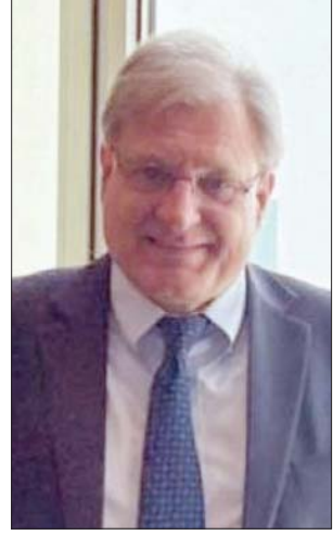
القاهرة، جمال جوهر

حذرت الولايات المتحدة من «كارثة بيئية» قد تنجم عن توقف ضخ النفط في ليبيا، وقالت: «على القيادة الليبية المسؤولين إدراك أن إغلاق الحقول والموانئ يضر بالمواطنين في جميع أنحاء البلاد، ويجب عليهم إنهاء إغلاق النفط على الفور».