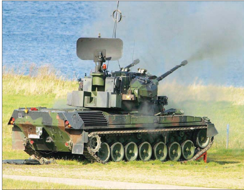
أعلنت ألمانيا أنها ستأذن بتسليم دبابات من طراز «غيبارد» إلى كييف فيما بعد نقطة تحول رئيسية في السياسة الحذرة التي اتبعتها برلين حتى الآن في دعمها العسكري لأوكرانيا

قال وزير الدفاع الأميركي لويد أوستن في ختام اجتماع أمني بمشاركة نحو 40 دولة في ألمانيا، جرى أمس (الثلاثاء)، إن الأسابيع المقبلة «شديدة الأهمية في مجرى الحرب الروسية على أوكرانيا»، وأضاف، إن المناقشات مع الحلفاء، ركزت على تعزيز قدرات الجيش الأوكراني على المدى الطويل، متعهداً بمواصلة تعزيز قدرته لخوض المعارك المقبلة المرتقبة. وأضاف، أن الهدف هو السعي إلى تعقيد مهمة موسكو في تهديد دول الجوار، مؤكداً أن «اجتماعنا الأمني سيكون مجموعة عمل للتواصل الشهري لتقييم قدرات أوكرانيا». وقال أوستن، إن القوات الروسية خسرت الكثير من المعدات والجنود في الحرب، مشيراً إلى صعوبة استبدال روسيا للمعدات التي خسرتها بسبب العقوبات التي فرضت عليها. وأشار أوستن بقرار ألمانيا دعم أوكرانيا بالأسلحة، قائلاً، إنه أمر جيد ويعود إليها.