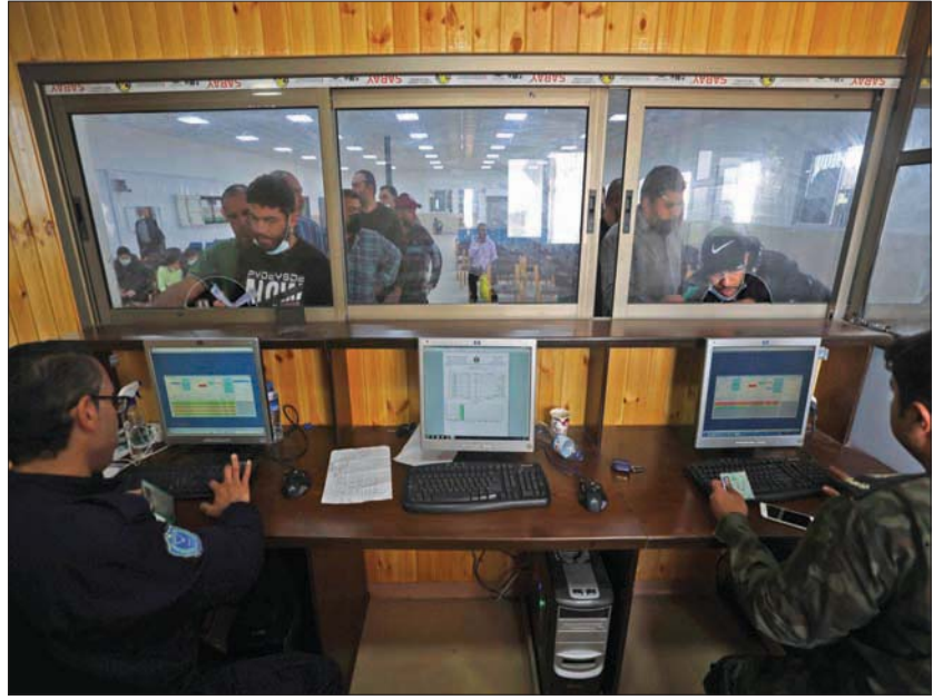
تدقيق في وثائق عمال ينتظرون العبور من غزة إلى إسرائيل بعد فتح معبر بيت حانون - إيرز

«إحتحامات جيش الاحتلال المتكررة والدموية للمدن والمخيمات والبلدات الفلسطينية، بما يرافقها من عمليات قمع وتكحيل وترهيب للمواطنين الفلسطينيين، كل ذلك يعكس عمق الانقلاب الإسرائيلي الرسمي على الاتفاقيات الموقعة، كما يعكس إصراراً متواصلًا ومفضوحاً على التصعيد وجر ساحة الصراع على دوامة من العنف». أما الجيش الإسرائيلي فقال إن قتل عويدات جاء أثناء حملة لاعتقال مطلوبين فلسطينيين في مخيم عقبة جبر من بين مناطق أخرى في الضفة شملت قباطية قرب جنين (شمال)، حيث اندلعت مواجهات عنيفة. وصرح المتحدث باسم الجيش الإسرائيلي بأن «الحادث قيد التحقيق» والتصعيد المستمر في الضفة وإن كان محدوداً، جاء مقابل إعادة غزة بعد أيام من الهدوء والتوقف عن إرسال صواريخ. وتوافد آلاف العمال والتجار من قطاع غزة، إلى إسرائيل أمس (الثلاثاء)، بعد أن أعادت سلطات الاحتلال فتح حاجز بيت حانون «إيرز» شمال القطاع. وبدأ العمال بالتجمع في وقت مبكر من فجر الثلاثاء، وانتظار فتح الحاجز المخصص للحركة الأفراد من غزة. وكانت سلطات الاحتلال أغلقت الحاجز يوم السبت الماضي، بعد إطلاق صواريخ من قطاع غزة، ثم قررت إعادة فتحه الثلاثاء، مشرطة استمرار الهدوء الأمني من أجل مواصلة التسهيلات الاقتصادية لغزة. وقرر منسق أعمال الحكومة الإسرائيلي ودول المنطقة،