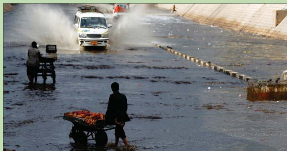
باعة جائلون يدفون عربات محملة بالفواكه على طول شارع غمرته المياه بعد هطول الأمطار في صنعاء

البرتقال في مارب انخفض بنحو 30 في المائة، ما أدى إلى خسائر في دخل العديد من الأسر الزراعية، وفي الوقت نفسه، وفقاً لمعلومات رئيسية، حقق مزارعو البصل في إب أيضاً انخفاضاً في الأرباح هذا الموسم بسبب الإفراط في الإنتاج وانخفاض الأسعار، أما في حين استمرت الأسعار العالية المرتفعة للحبوب الأساسية وزيوت الطهي في دفع زيادات كبيرة في الأسعار في البلاد حيث عمل التجار على الحصول على هذه السلع من الأسواق البديلة بأسعار أعلى. وبين التقرير أن إنتاج البن من القمح لا يغطي سوى أقل من 10 في المائة من الاحتياجات ولهذا تتم تغطية معظم الإمدادات الغذائية الأساسية من خلال الواردات التجارية، وهو ما جعل البلاد «شديدة التأثر بإمدادات الغذاء العالمية وصدقات الأسعار».