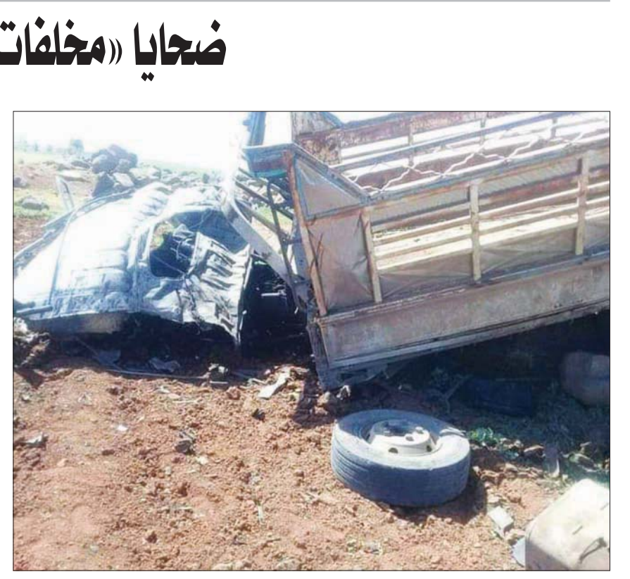
صورة نشرها موقع «درعا» 24، لسيارة تضررت من انفجار مادة من «مخلفات الحرب» بريف درعا

تحدثت وسائل إعلام قريبة من الحكومة التركية عن خطط لإعادة مليون ونصف المليون لاجئ سوري إلى بلادهم خلال 15 إلى 20 شهراً من الآن عبر جعل مناطق العمليات العسكرية التركية مناسبة من الناحية المعيشية والاقتصادية لعودة اللاجئين، مشيرة إلى أنه إلى جانب مشاريع المنشآت الصناعية المنظمة في مناطق درع الفرات وغصن الزيتون ونبع السلام، أنفتت الحكومة التركية كل التحليلات والدراسات اللازمة لبناء 200 ألف منزل بتمويل قطري في المناطق نفسها، وتم طرحها للمناقشة.