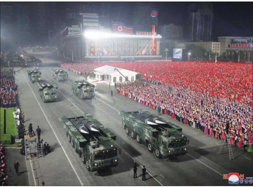
عربات تحمل صواريخ باليستية خلال العرض العسكري في بيونغ يانغ

عرض أسلحة جديدة انتقد فريق الرئيس المنتخب يون سوك يول، الذي سيتولى السلطة في العاشر من مايو (أيار) المقبل، بيونغ يانغ لأنها تصنع أسلحة تمثل تهديداً بينما تبدو أنها تتابع المحادثات.