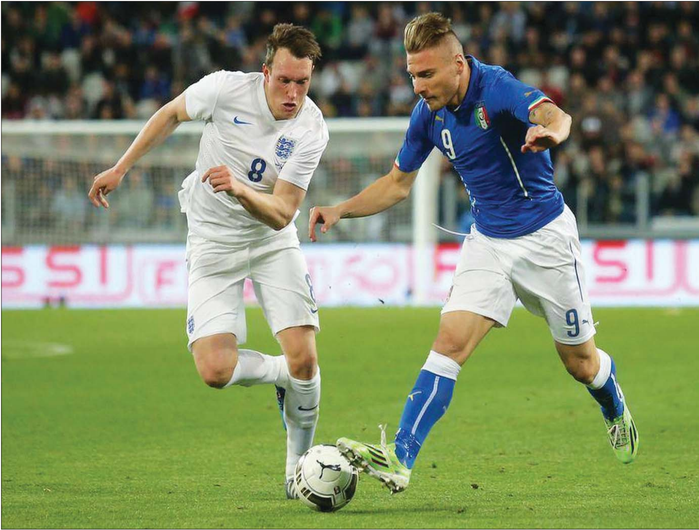
في عام 2017 أشاد مدرب إنجلترا ساوثغيت بجونز ووصفه بأنه أفضل مدافع في إنجلترا (ريتورن)

ريد ليون الرياضي، وهو منصة رقمية ستسمح لمجتمع الإنترنت بالتجمع حول الأحداث الرياضية الكبرى - بدءاً من التصفيات في الدوري الأميركي لكرة السلة للمحترفين وصولاً إلى كأس العالم لكرة القدم. وسيضم النادي في البداية نحو 4 آلاف عضو سيدفعون نحو 160 دولاراً لشراء رمز غير قابل للاستبدال. يعمل كبطاقة عضوية رقمية. وسيستضيف النادي عروضاً حية حصرية سينضم إليها جونز ورياضيون ومشاهير آخرون. يقول جونز: «لقد حاولت الإبتعاد عن وسائل التواصل الاجتماعي على مدار السنوات الماضية، لكن هذا المشروع يقدم فرصة رائعة للأشخاص للانخراط في مجتمع صديق للعائلة».