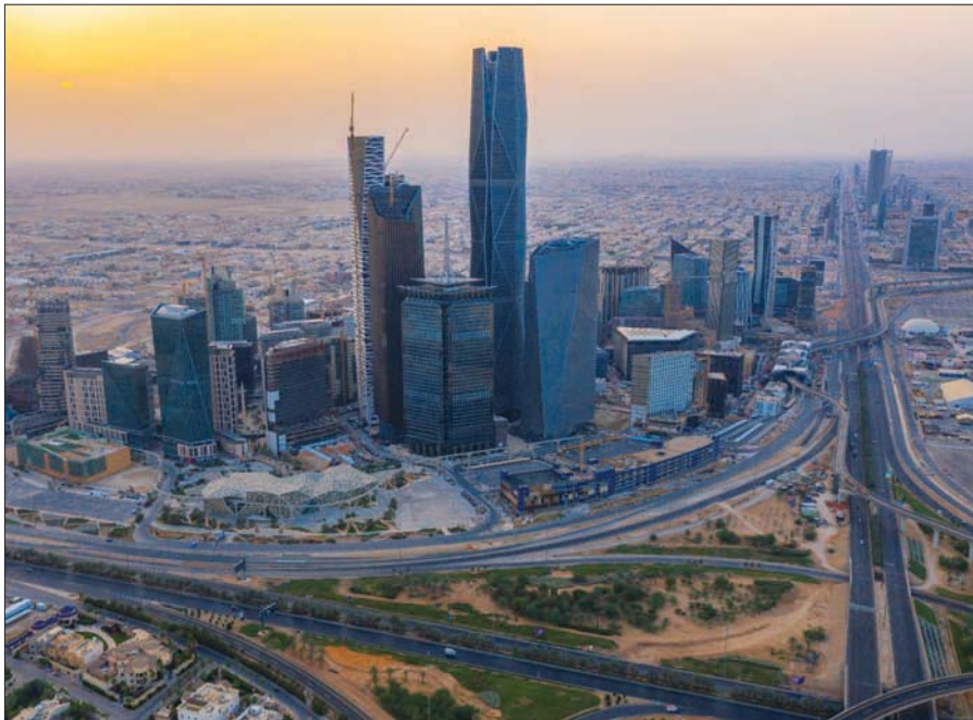
السعودية مرشحة لأقل مستوى تضخم بحسب استطلاع رويترز لخبراء الاقتصاديين (الشرق الأوسط)