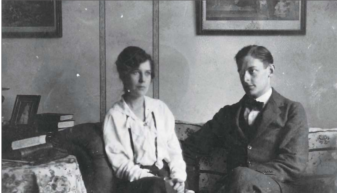
فيضان هايوود وت. س. إليوت

على أن الصعاب المختلفة التي واجهت الزوجين، لم تكن إليوت عن محاولة إنقاذ وضعهما المترنح، مؤثراً والاعتماد عن عائلة زوجته والسفر إلى إيسيتون، على أمل أن ينعموا هناك بالراحة والهدوء. لكن الرحلة تلك بدت أشبه بشهر عسل زائف، كما عبّر برتراند رسل، الذي وصله من فيضان رسالة قانطة وصفها لاحقاً بأنها تشبه إلى حد بعيد الرسائل التي يتركها الباحثون خلفهم قبل أن يُقدّموا على الانتحار. وفي قراءته الشخصية للتحليل العائلي بين الزوجين، رأى رسل، الذي اعترف في وقت لاحق بخيانة صديقه الأثير عبر دخوله في مغامرة عاطفية قصيرة مع هايوود، بأن مرء ذلك التدهور هو نظريتها المتبانية إلى الشهوة الجسدية، الأمر الذي دفع إليوت إلى اعتبار الفعل الجنسي شكلاً من أشكال العنف والفعل العدائي. والأرجح أن هذا الخلل المطرد في علاقة الزوجين، هو الذي دفع بعض الدارسين إلى الحديث عن ضعف الشاعر الجنسي، والبعض الآخر إلى الحديث عن نزوعه المثلي، في حين عمد البعض معتبرين أن السبب الفعلي لابتعاده عن الفراش الزوجي هو نفوره من شراهة زوجته الجنسية من جهة، والتناقض المساسي لحالتها العصبية والعقلية من جهة أخرى. وإذا كان الشعر في دلالاته العميقة هو الترجمة الأصق لخلاجات النفس، فإن إليوت يعبر في بعض قصائده عما يناهه إزاء رغبات الجسد وغرائزه المتجانسة لعقول ثلاثة متلاحقة، لا يلبث أن وفر له الشعور بالراحة والأمان والحب الحقيقي، حين تزوج في سنوات حياته الأخيرة من سكرتيرته فاليري فلتشر. ورغم أن فلتشر كانت تصغره بفنائية ثلاثين عاماً، فهي قد استطاعت بما تخطته من داخلها من حب وحكمة ونضج، أن تكون حتى لحظة وفاته عام 1965، وهو الفعلي وملاكه الحارس وصمام أمانه الأمل، في الحقبة الفاصلة بين الكهولة والموت.