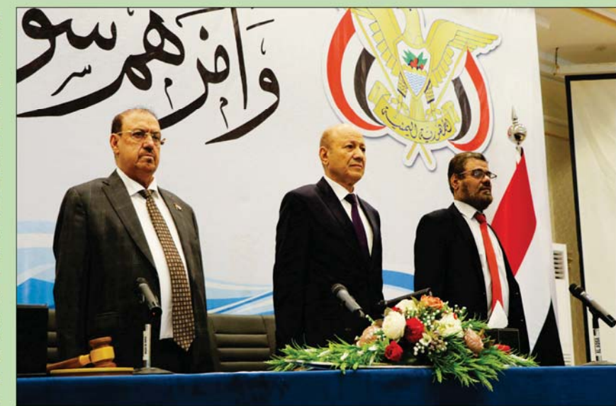
جانب من جلسة عقدها البرلمان اليمني لمنح الثقة للحكومة في عدن قبل أيام