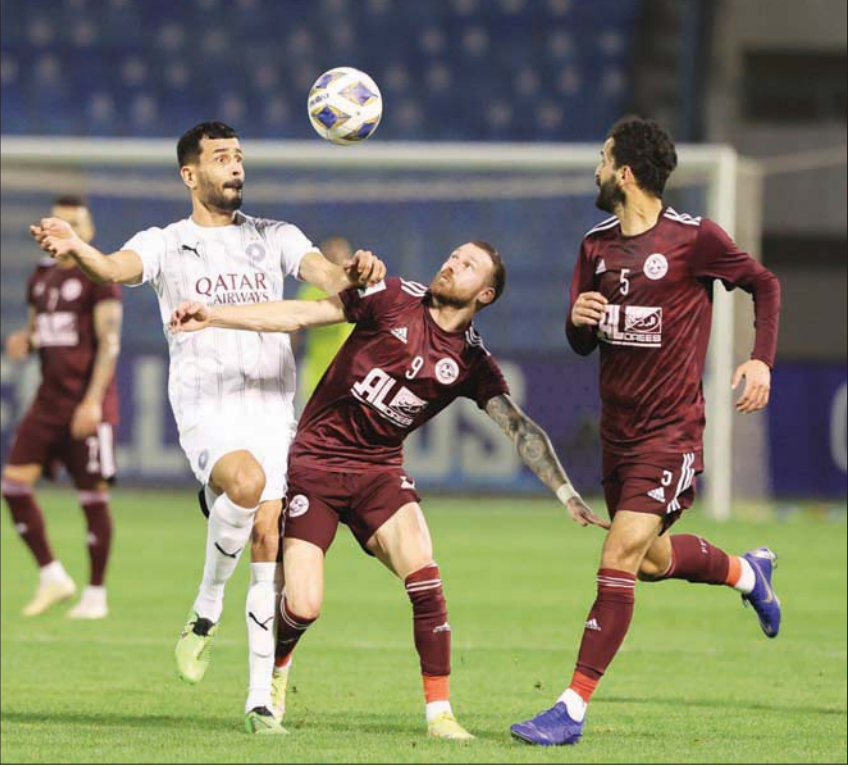
الفيصلي ينشد التأهل إلى ثمن النهائي الآسيوي عبر بوابة السد