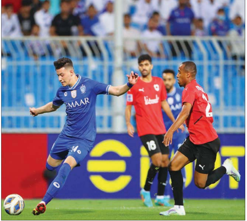
الهلال يتطلع لتكرار فوزه على الريان القطري

الشارقة الإماراتي نظيره استقلول دوشنبه الطاجيكي في مباراة يامل معها الفريق الإماراتي تحقيق انتصار معنوي خصوصاً بعد خروج الفريقين من دائرة المنافسة على التأهل، إذ يملك الشارقة 5 نقاط في الوقت الذي لا يملك فيه الهلال الطاجيكي أي نقطة ويتذلل ترتيب المجموعة الأولى.