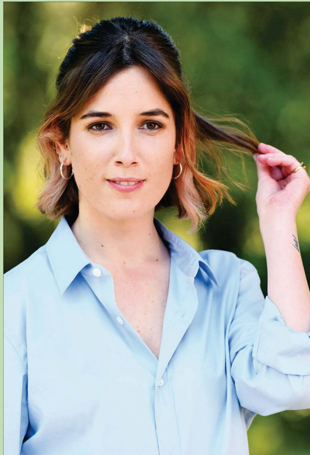
المثلة الإيطالية جيوفيتا فاسيلي خلال جلسة تصوير لفيلم «كوزا نوسترا» في روما الذي سيُعرض في دور العرض الإيطالية اعتباراً من 5 مايو 2022 فصاعداً

نعم، هناك في مصر وفي السعودية والإمارات اليوم، مثلاً، من يرى أن الشكل الصحيح للوجود هو شكل تنظيم القاعدة أو الإخوان أو السوروي، ولكنه يخفي إيمانه ويعيش حسراته المكتومة، مع «غمر» مياه الهوية الجديدة لرمال هويته،