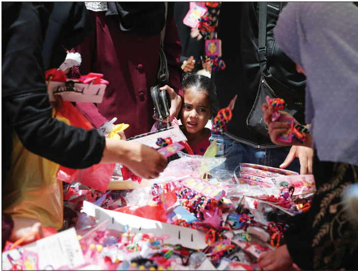
في سوق من أسواق خان يونس بجنوب قطاع غزة... استعدادات ما قبل احتفالات عيد الفطر المبارك

وتصدر هذه الأعمال الثلاثة قائمة الأعلى مشاهدة حالياً في السعودية ودول خليجية عدة، حسب منصة «شاهد» التابعة لقنوات