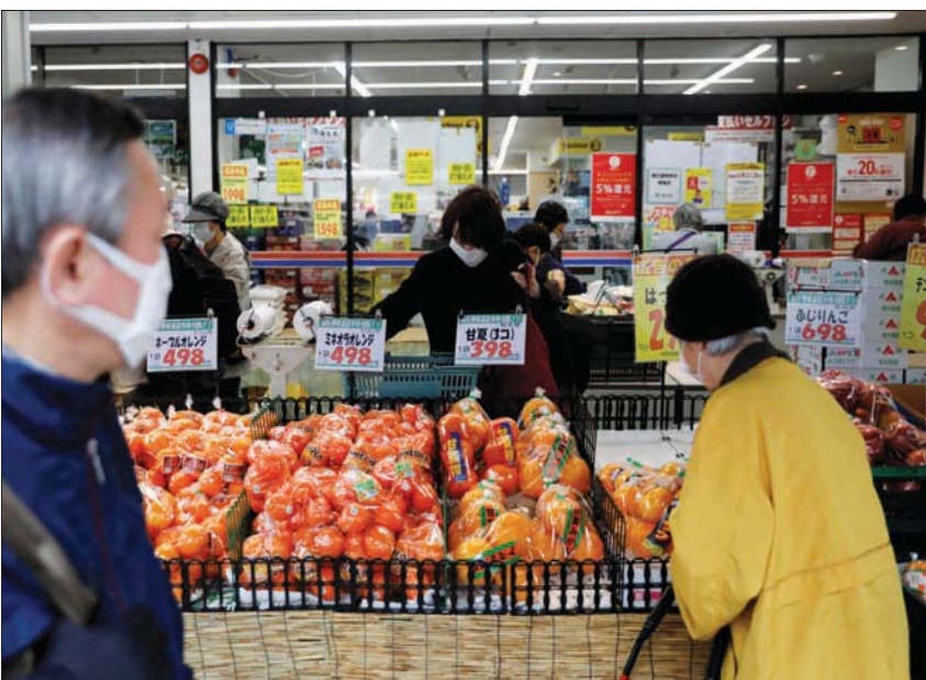
مستوقون في أحد أسواق مدينة طوكيو

وقال كيشيدا في إحاطة إعلامية، وفق ما نقلته وكالة أنباء «كيودو» اليابانية. إن مستويات العملة تعكس نتائج مزروجة» التي تعرض لها الاقتصاد الوطني وجاء بسبب جائحة «كوفيد - 19» والأزمة في أوكرانيا. وتتكون حزمة الطوارئ من أربع ركائز أساسية: الحد من أسعار النفط، وضمان إمدادات غذائية مستقرة، وتقديم الدعم للشركات الصغيرة والمتوسطة الحجم، ومساعدة الأسر المتعثر، حسب «كيودو».