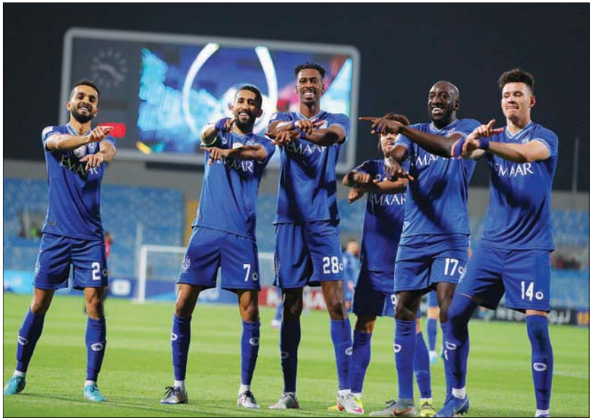
الهلال خامس أقوى الأندية الآسيوية إنفاقاً

وأقرنت هذه القوة الشرائية إلى حد كبير بنفقات ومصاريف الانتقالات الخاصة بالأندية السعودية، والتي ظهرت 4 أندية