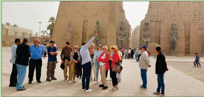
السياحة المصرية تتميز بتنوعها الترفيهي والثقافي