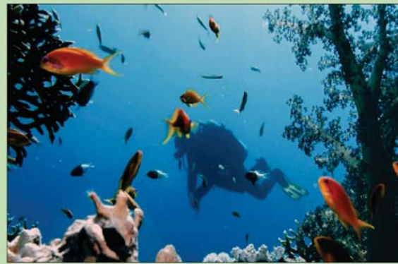
سياحة الغوص في مصر

وافقت الحكومة المصرية أخيراً على تقديم حزمة تسهيلات، وصفت بأنها «غير مسبوق» لإنعاش قطاع السياحة الذي يعاني من تداعيات الحرب الروسية - الأوكرانية، ومتحور «أوميكرون»، حيث تمت الموافقة لأول مرة على منح الأجانب القادمين إلى البلاد تأشيرة دخول اضطرارية في منافذ الوصول المختلفة شرطة حملهم تأشيرات دخول سارية لدول اليابان وكندا وأستراليا ونيوزيلندا والولايات المتحدة وبريطانيا ودول منطقة «شغن». ووفق قطاع السياحة المصري تعافياً سريعاً، قبيل ظهور متحور «أوميكرون»، واندلاع الحرب الروسية الأوكرانية، وتحديداً خلال النصف الأخير من عام 2021 بنسبة تقرب من المعدلات التي حققها القطاع في التوقيت ذاته من عام 2019 والتي تعد الأفضل خلال العقد الماضي، حسب وزير السياحة والآثار المصري، الذي يتوقع تعافي السياحة المصرية من أزمة التضخم العالمية، وتداعيات الحرب الروسية الأوكرانية، وخلال العامين المقبلين.