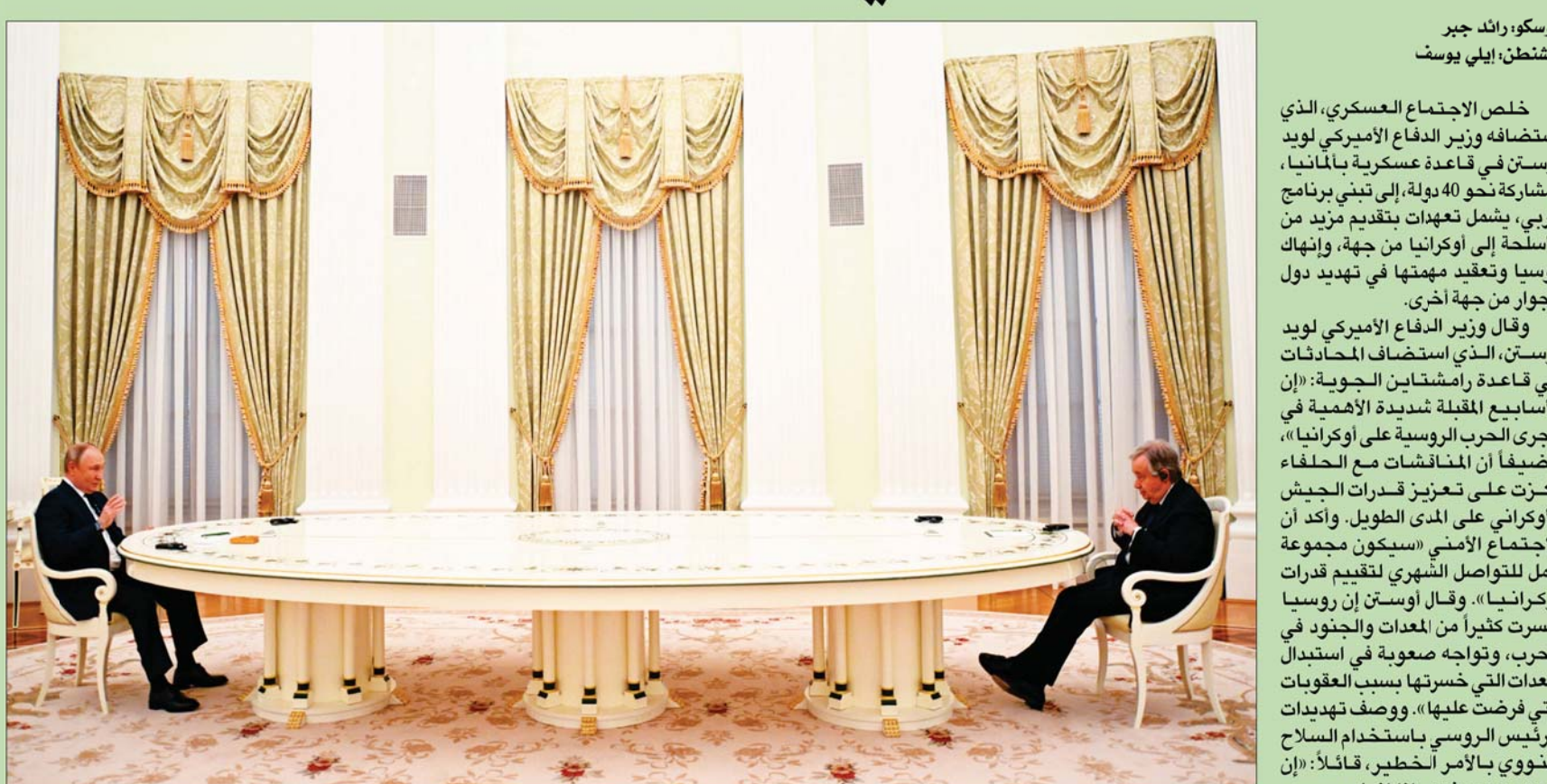
بوتين خلال اجتماعه مع غوتيريش في الكرملين أمس