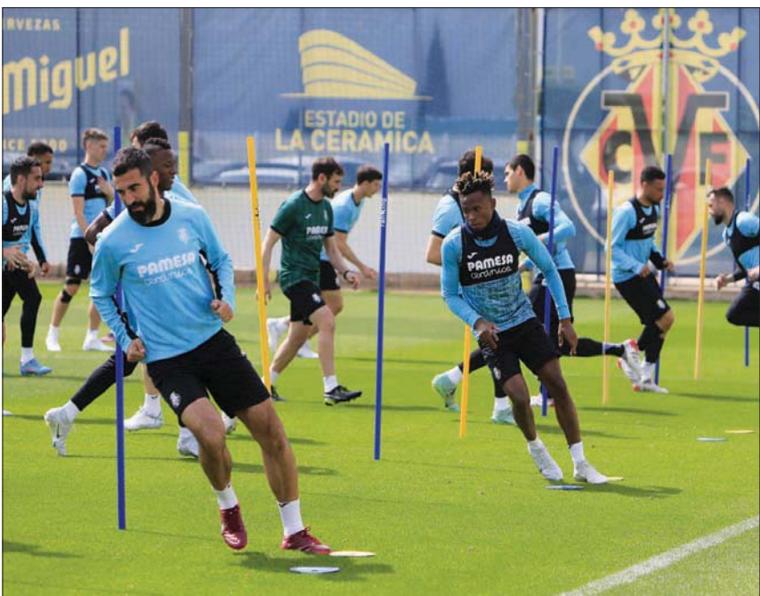
لاعبو فياريال خلال التدريبات استعداداً لموقعة أنفيلد