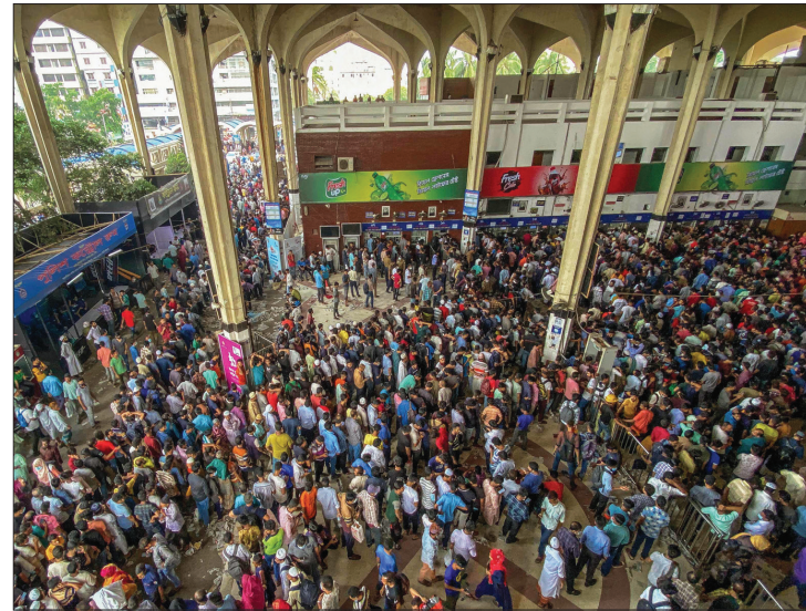
بنغلاديشيون في محطة للسكك الحديدية بالعاصمة دكا يشكرون تذاكر مسابقة للسفر للاحتفال بعيد الفطر المبارك