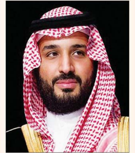
جدة، «الشرق الأوسط»

بحث الأمير محمد بن سلمان بن عبد العزيز، ولي العهد نائب رئيس مجلس الوزراء وزير الدفاع السعودي، ورئيس الوزراء البريطاني بوريس جونسون، مجالات التعاون