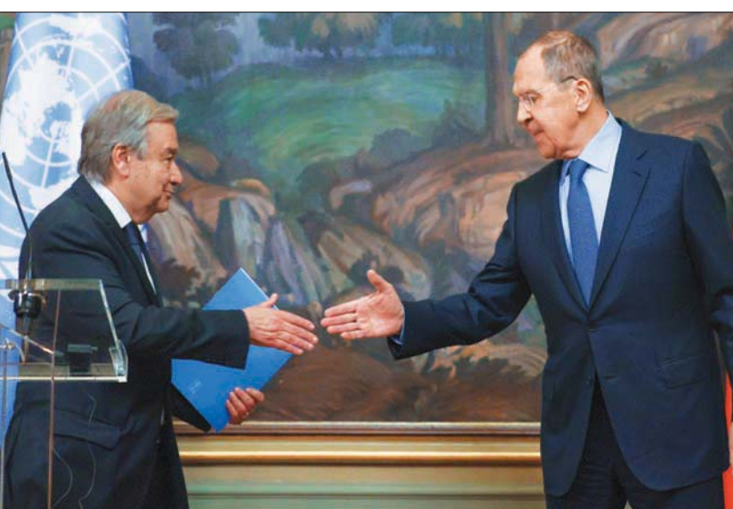
قال لافروف، خلال اجتماعه أمس مع غوتيريش، إن الوضع حول أوكرانيا أصبح حافراً لكثير من المشكلات التي تراكمت في المنطقة الأوروبية - الأطلسية (أ.ب.أ)

وأضاف مخاطباً الأمين العام: «لقد استجبنا على الفور لمبادراتكم لإجراء اتصالات في موسكو بشأن كثير من القضايا المهمة، بما في ذلك بالطبع الوضع حول أوكرانيا، الذي حفز كثيراً من المشكلات التي تراكمت على مدى العقود الماضية