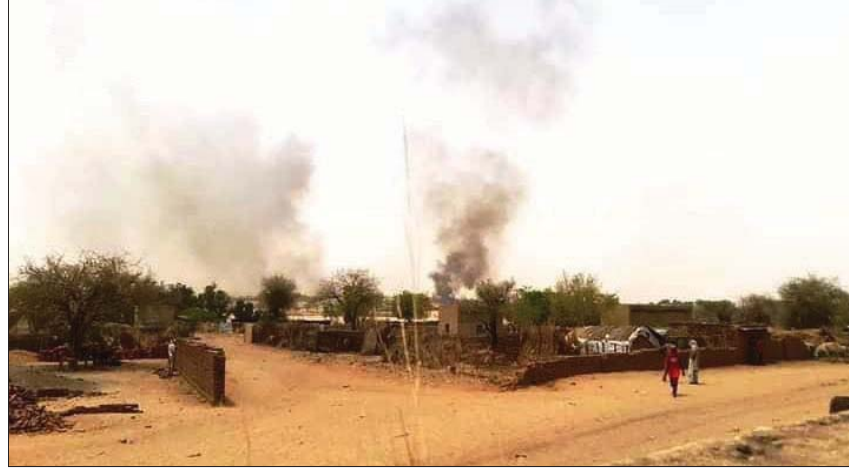
صورة نشرها موقع «دببقا» للمعارك قبل أيام في دارفور

ومن جانبها، أدانت السفارة الأميركية في الخرطوم بشدة العنف المرتكب ضد المدنيين وتشريد الآلاف في «كربنك»، غرب دارفور، وحثت جميع الجناة على الكف فوراً عن هذه الأعمال.