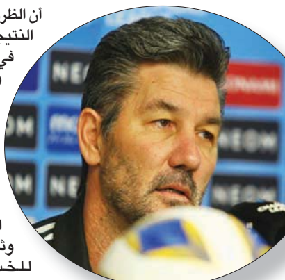
مدرب الفيصلي خلال المؤتمر الصحفي أمس

أن الظروف حثمت علينا القبول بهذه النتيجة خصوصاً أن الوحدات تقدم في النتيجة في وقت صعب جداً وكان لزاماً عدم خسارة هذه المباراة».