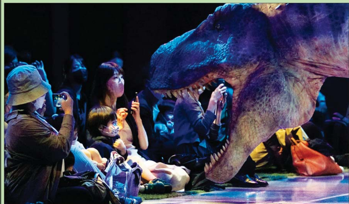
عرض لديناصور بأية «دينو ترونيكس»

القاهرة: حازم بدر أن الخفاش ربما يكون قد أبحر باستخدام ساحل بحر المتوسط، حيث توجد الخفافيش الأخرى بشكل شائع على طول هذا الساحل خلال موسم الهجرة. وفي أوروبا، نادراً ما تحلق الخفافيش لمسافة تزيد على 1000 كيلومتر، وحتى في المناخات الاستوائية، تهاجر بعض الخفافيش لمسافة تصل إلى 2000 كيلومتر فقط، ولا يعرف لماذا اتخذ الخفاش مثل هذه الطريق الطويلة، ويخمن فاسينكوف ورفاقه أنه ربما يكون قد ضاع أثناء طريق الهجرة المعتاد، أو ربما تكون الهجرات الطويلة أكثر شيوعاً مما كان يعتقد سابقاً. ويعتزم الفريق البحثي مواصلة عملهم للحصول على مزيد من المعلومات حول طرق الهجرة، وكيف تتجه الخفافيش أثناء الهجرة، وهو اهتمام بحثي فاسينكوف من معهد سيفيرتسوف للبيئة والتطور بالأكاديمية الروسية للعلوم التي نشرته أول من أمس دار نشر «ديجورتر» التي تصدر دورية «الغديبات»، «اعتقدنا أن خفافيشنا كانت تهاجر إلى دول في جنوب شرقي أوروبا في ودول مجاورة أخرى، وليس إلى فرنسا»، ويعتقد فاسينكوف، ورفاقه من المشاركين في البحث،