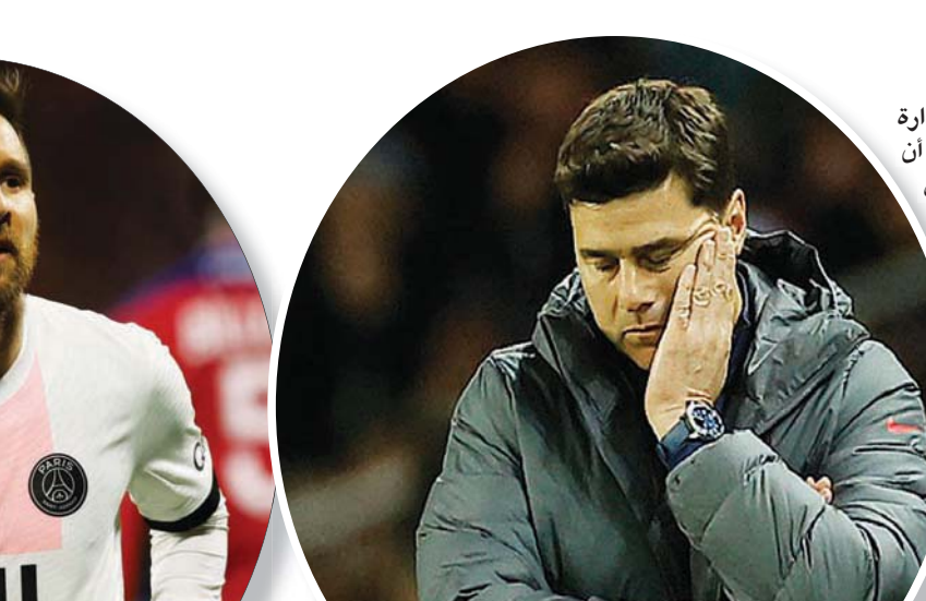
ميسي يتطلع للفوز بدوري الأبطال

مفاوضات تمديد عقده المنتهي بنهاية هذا الموسم إلى نتائج إيجابية حتى الآن وسط ما يتردد من أنه في الطريق للانضمام إلى ريال مدريد الإسباني. ولا يزال مستقبل المدير الفني للفريق، ماريو بوكيتينو، والمدير الرياضي البرازيلي ليوناردو، غير معروف بعد.