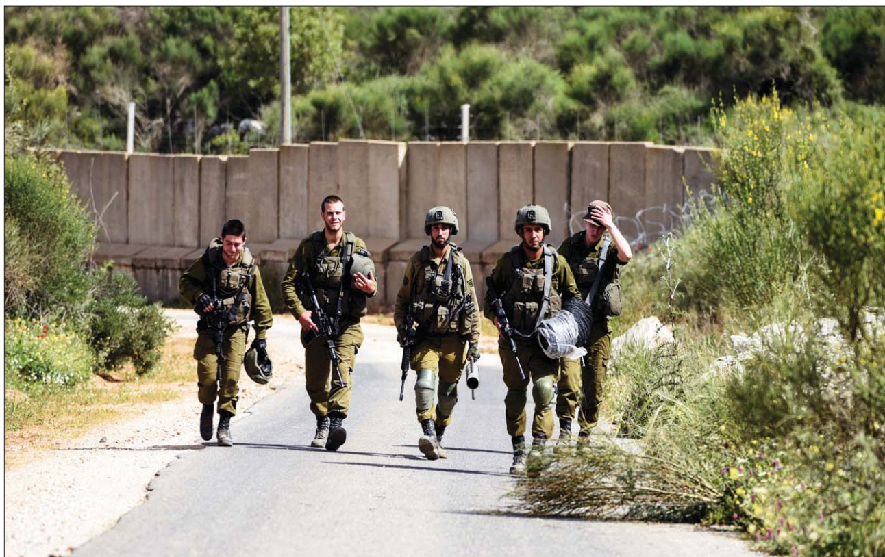
جنود إسرائيليون قرب الحدود الشمالية مع لبنان

شرفة المنزل من أجل جمع معلومات استخباراتية والتعرف على البيات عمل وتحرك قوات الجيش الإسرائيلي في المحيط. من بعدها، يقوم شيت (الحزب) بغرض تنفيذ عمليات عبر تطبيقات تواصل مختلفة، مثل «تلغرام»، لتنسيق موعد تنفيذ عملية التهريب، مستعيناً بأشخاص مختلفين يصلون إلى النقطة المحاذية ويقومون برمي المهربات (مخدرات أو أسلحة) من الحدود في الوقت الذي يقوم فيه برصد العملية من بيته وإرشاد المهرب الإسرائيلي من أجل مساعدته في التخفي عن القوات الإسرائيلية العاملة في المنطقة. وحسب بيان للشرطة الإسرائيلية، أمس، فإن «وحدة الحدود في منطقة الشمال تعمل في جميع المناطق الحدودية الشمالية، مع لبنان وسوريا والأردن، وعمليات الشرطة عند الحدود تمنع وصول كميات كبيرة من الأسلحة والمخدرات إلى البلدات في الدولة واستخدامها من جانب مجرمين ومنفذي عمليات معادية لأهداف إرهابية وعنفية وتجارية».