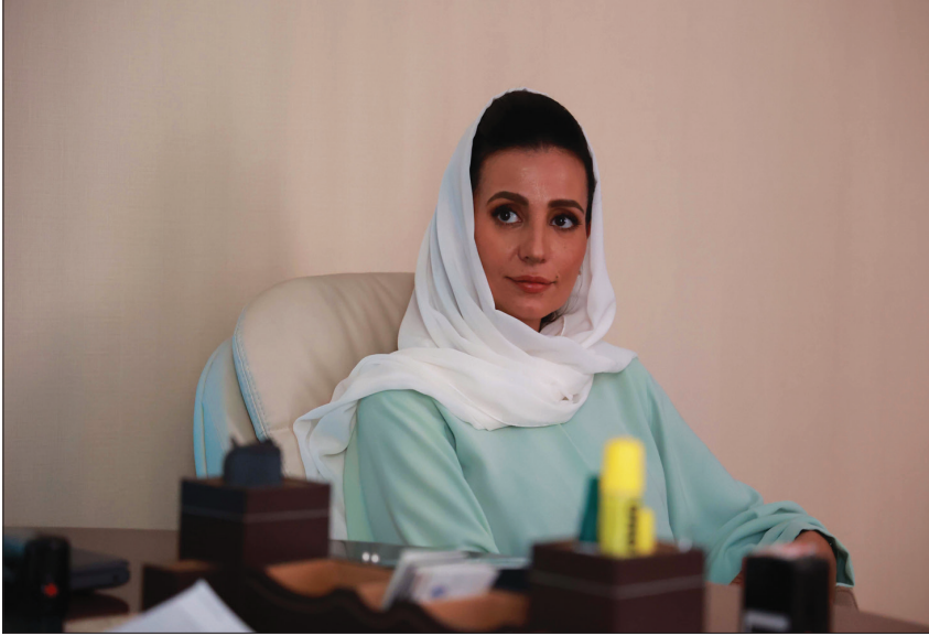
الممثلة السعودية هند محمد بدور الأم «أنيسة» في مسلسل «منهو ولدنا»

وعند الوقوف على تجربة محمد مع أدوار الأمومة، يمكن العودة إلى الوراء حين بدأت مسيرتها الفنية بعد خيرة إعلامية امتدت من عام 2003 إلى 2010، مشيرة إلى أنها حصلت على لقب أول ممثلة سينمائية سعودية، وفي رصيدها الفني اليوم أكثر من 37 مسلسلاً، و3 مسرحيات، و8 أفلام، وعن رأيها في مستقبل الدراما السعودية تقول: «هناك فقرة كبيرة وملحوظة في صناعة الدراما السعودية، فالأبواب لم تعد موصدة في وجه أحد، وسيكون للدراما السعودية نجاح منقطع النظير».