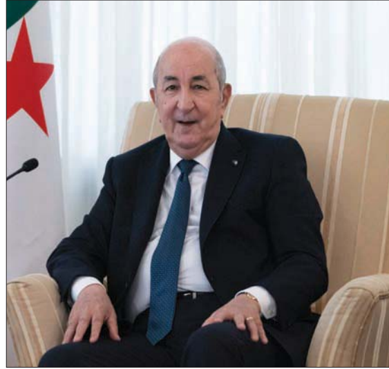
الرئيس الجزائري عبد المجيد تبون

التوصل لحل لهذا النزاع». وقال تبون، إن الجزائر تطالب «بتطبيق القانون الدولي حتى تعود العلاقات إلى طبيعتها مع إسبانيا، التي يجب ألا تتخلى عن مسؤوليتها التاريخية، فهي مطالبة بمراجعة نفسها». وتعدده بالمقابل بعدم تخلي الجزائر عن تعهداتها بتزويد إسبانيا بالغاز «مهما كانت الظروف». وكان لافتاً بعد إعلان بيدرو سانشيز دعم رؤية الرباط لحل النزاع، إن الغضب الجزائري من الشريك الأوروبي الكبير لن يكون مجرد سحابة صيف سرعان ما تنقشع أو تَمُر. فقد سحبت الجزائر سفيرها من مدريد، وربطت عودته بـ«تقديم توضيحات مسبقة وصرحة حتى يمكن إعادة بناء الثقة المتضررة بشكلة خطيرة، بناءً على أساس واضحة ومطابقة للقانون الدولي». مبرزة أن مسألة التحاق السفير بمنصبه من جديد «ستقرها السلطات