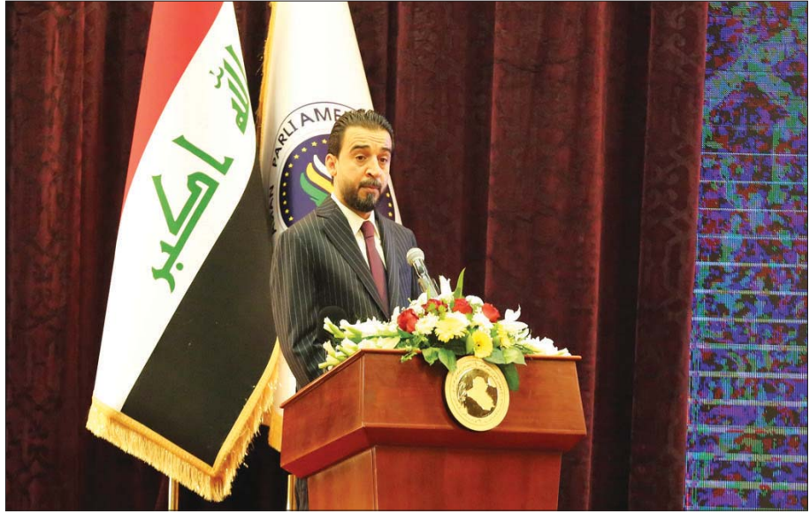
رئيس البرلمان العراقي محمد الحلبوسي

لأن من مصلحة السنة عودة أصحاب الخبرات السياسية مع وجود أكثر من تكتل سياسي على أن يتوافر النضج السياسي الذي يعدهم عن الصراعات والارتقاء بساحة جهة سياسية أخرى أو حتى دول خارجية»، مشيراً إلى أنه «من المتوقع أن تشهد مصالحة بين الحلبوسي والشيخ علي حاتم السليمان، أما العيسوي فلن يدخل في خصومة مع طرف لحكتته المعروفة».