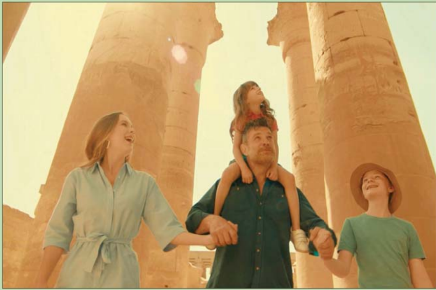
لقطة من حملة ترويجية للسياحة المصرية (وزارة السياحة والآثار المصرية)

وافقت الحكومة المصرية أخيراً على تقديم حزمة تسهيلات، وصفت بأنها «غير مسبوق» لإنعاش قطاع السياحة الذي يعاني من تداعيات الحرب الروسية - الأوكرانية، ومتحور «أوميكرون»، حيث تمت الموافقة لأول مرة على منح الأجانب القادمين إلى البلاد تأشيرة دخول اضطرارية في منافذ الوصول المختلفة شرطة حملهم تأشيرات دخول سارية لدول اليابان وكندا وأستراليا ونيوزيلندا والولايات المتحدة وبريطانيا ودول منطقة «شغن». ووفق قطاع السياحة المصري تعافياً سريعاً، قبيل ظهور متحور «أوميكرون»، واندلاع الحرب الروسية الأوكرانية، وتحديداً خلال النصف الأخير من عام 2021 بنسبة تقرب من المعدلات التي حققها القطاع في التوقيت ذاته من عام 2019 والتي تعد الأفضل خلال العقد الماضي، حسب وزير السياحة والآثار المصري، الذي يتوقع تعافي السياحة المصرية من أزمة التضخم العالمية، وتداعيات الحرب الروسية الأوكرانية، وخلال العامين المقبلين.