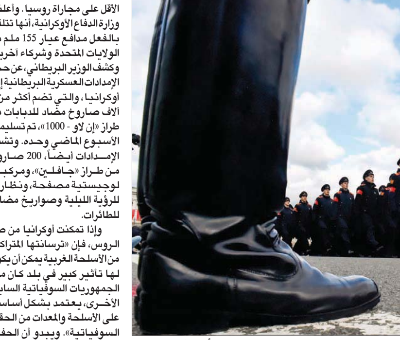
رغم الحرب الأوكرانية التي كبدتها خسائر فادحة تحضر موسكو لاحتفالات الانتصار على النازية قبل 77 عاماً (أ.ب.أ)

وإذا استمرت الحرب الأشهر، فإن استهلاك العتاد الروسي وتدميره، على جانب العقوبات الغربية وحظر التصدير، يسعوق قدرة موسكو على إمداد القوات بمعدات أفضل.