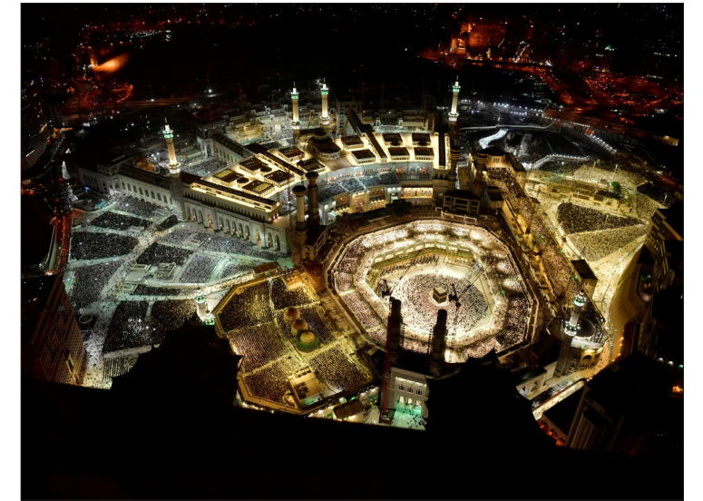
مسلمون يؤدون صلاة التراويح بالمسجد الحرام في مكة المكرمة بالسعودية خلال الشهر المبارك