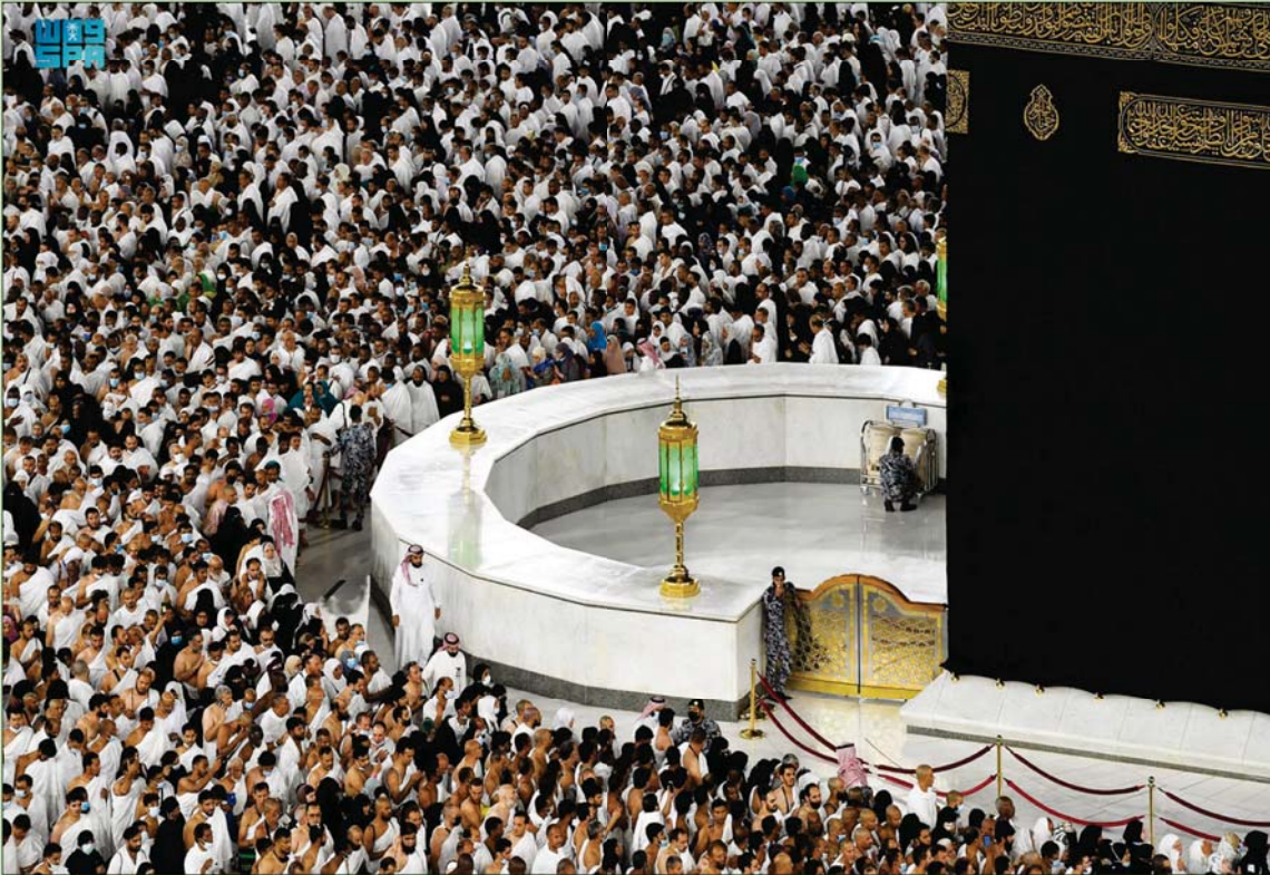
تزداد أعداد المعتمرين في العشر الأواخر من رمضان... وفي الصورة المعتمرون يطوفون حول الكعبة أمس (الشرق الأوسط)

تشمّل «الإقامة، والتنقل» فيعد العقوبات المالية التي طالت 10 شركات لتقصيرها في تقديم الخدمات المطلوبة قبل أيام عدة، أوقفت الوزارة إحدى الشركات في قطاع العمرة لعدم التزامها بالأنظمة وخدمة ومتابعة المعتمرين. وأكدت وزارة الحج، أنها لن تسمح أو تتهاون في أي تقصير يمس خدمة ضيوف الرحمن، وأنها ماضية في حماية حقوقهم مع مزودي الخدمة، من خلال جولاتها الرقابية المكثفة على جميع مواقع الخدمات، والتفاعل مع بلاغات المعتمرين، باتخاذ الإجراءات النظامية كافة لمحاسبة المقصرين؛ سعياً إلى رفع مستوى جودة الخدمات المقدمة لضيوف الرحمن، وحفاظاً على سلامتهم.