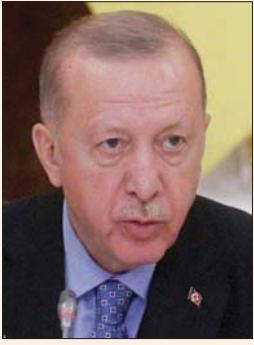
رجب طيب أردوغان

وكان بايدن استخدم، في بيان نشره الأحد الماضي، مصطلح «إبادة جماعية» لوصف ما حدث للمليون ونصف المليون من الأرمن قتلوا على أيدي الجنود العثمانيين في 1915، بأنه «واحد من أسوأ الفظائع الجماعية في القرن العشرين». وقال: «أوقفت السلطات العثمانية متفكرين وقادة من الأرمن في القسطنطينية، وهكذا بدأت إبادة الأرمن، واليوم، نتذكر مليون ونصف المليون أرمني تم قتلهم أو ذبحهم أو ساروا حتى وفاتهم في حملة إبادة». وتقر تركيا بحدوث مجازر، لكنها ترفض استخدام مصطلح «الإبادة الجماعية»، متطرفة إلى حرب أهلية في الأناضول مصحوبة بمجاعة قضى خلالها ما بين 300 و500 ألف أرمني وما يعادلهم من الأتراك.