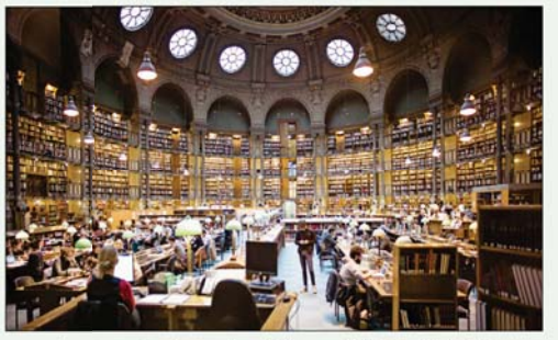
المكتبة الوطنية الفرنسية في باريس