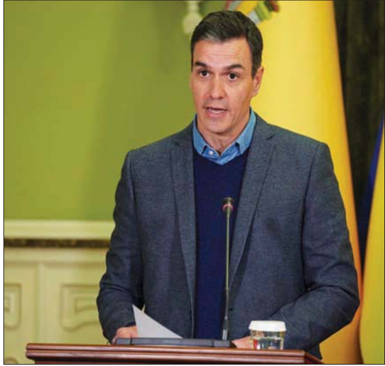
رئيس الوزراء الإسباني بيدرو سانشيز