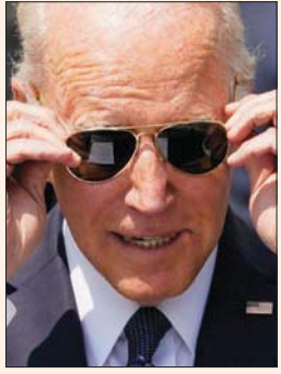
جو بايدن (أب)

وتحريض من دول أجنبية، بينما كانت الدولة العثمانية تخوض كفاحاً صعباً إبان الحرب العالمية الأولى، موضحاً أن عدد الضحايا المسلمين الذين قتلهم تلك العصابات بكل وحشية، يبلغ أضعاف عدد القتلى من الأرمن، رغم محاولات الة الدعاية الأرمنية تضخيم العدد. وأكد أن مقتل أي إنسان وجذوره بعد «مأساة».