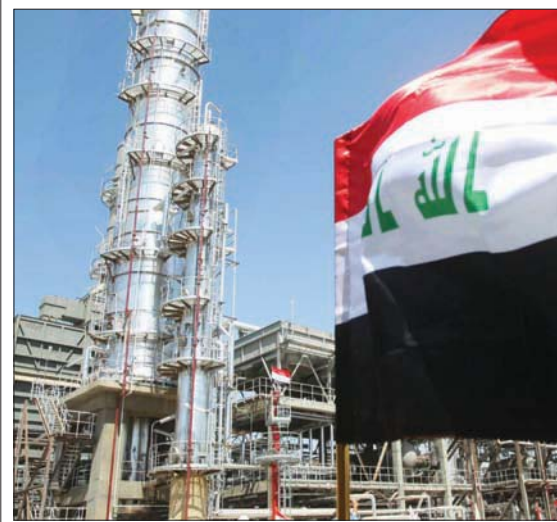
برلين: «الشرق الأوسط»