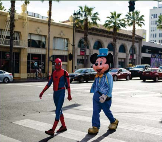
شخصان يرتديان زي سبايدرمان وميكي ماوس في شارع بيهوليود

وأعرب مخرج فيلم «دون»، دوني فيلنوف متحدثاً من بودابست عن: «قلقه من تقليص فترة اعتماد هذه النافذة تدريجياً»، داعياً إلى تمديدتها ليبقى الذهاب إلى السينما تجربة «فريدة» و«ثمينة» وينتهي ملتقى «سينما كون» الخميس، مع عرض لفيلم «توب غان مافريك» لشركة «باراماونت بيكتشرز»، وهو تكلمة لفيلم «توب غان» (1986) الذي ينتظره الجمهور بحماس.