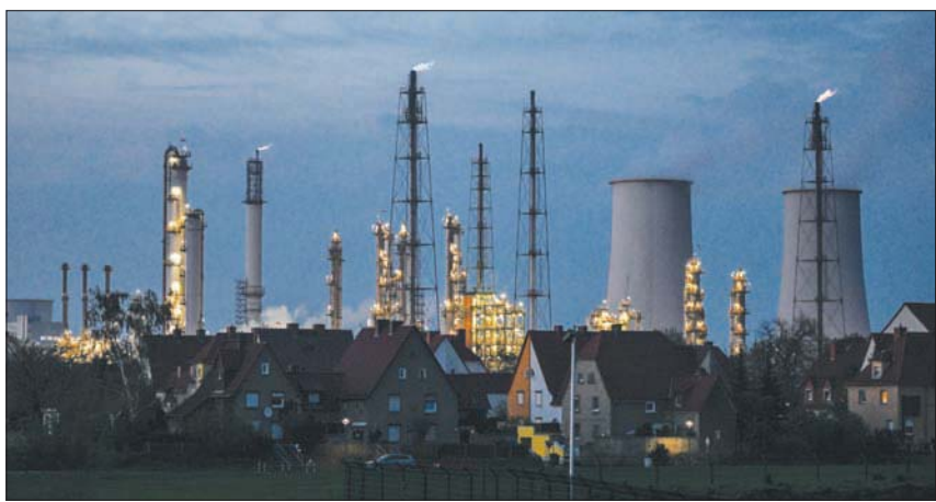
مصفاة نفط ليونا التابعة لشركة «توتال» بالقرب من سبيرجوا شرق ألمانيا

ولا تتوقع ألمانيا الاستغناء عن الغاز الروسي قبل منتصف 2024. وقالت وزارة الطاقة الألمانية، إن ألمانيا ستحتاج إلى 1,2 مليار متر مكعب من الغاز الطبيعي الإضافي لتعويض النقص في الإمدادات الروسية. وقالت الوزارة: «تجب تهيئة عدد من الظروف لهذا التحول: من الضروري الحصول على واردات عبر الموانئ، ونقل المنتجات النفطية على متن شاحنات وقطارات»، مؤكدة أن الشركات والحكومة الألمانية تعمل بجهد كبير لتهيئة هذه الظروف. وبسبب الهجوم الروسي على أوكرانيا، قرر الاتحاد الأوروبي حظر واردات الفحم الروسي. وهناك أيضاً نقاش مستمر حول