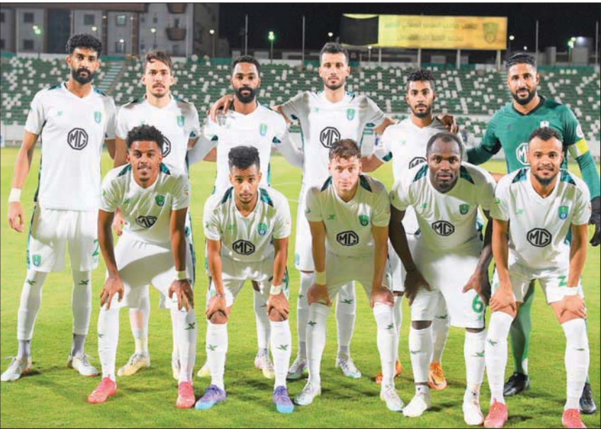
الأهلي حل في المرتبة السادسة آسيوياً من ناحية الإنفاق خلال الفترة ما بين 2021 و2022 (التشرق الأوسط)

أي صفقات انتقال حر، 5 عودة من الإعارة، 10 تمديد إعارة، 2 من الإعارة إلى الانتقال الدائم، 18 إعارة، و28 لاعباً في شكل انتقال دائم، وهذا بعد تماشياً واضحاً مع الاتجاهات العالمية التي ركزت أكثر على صفقات الانتقال الحر مع اللاعبين المتهتمين عقودهم، مما جعل الأندية السعودية تسير على المسار نفسه تقريباً.