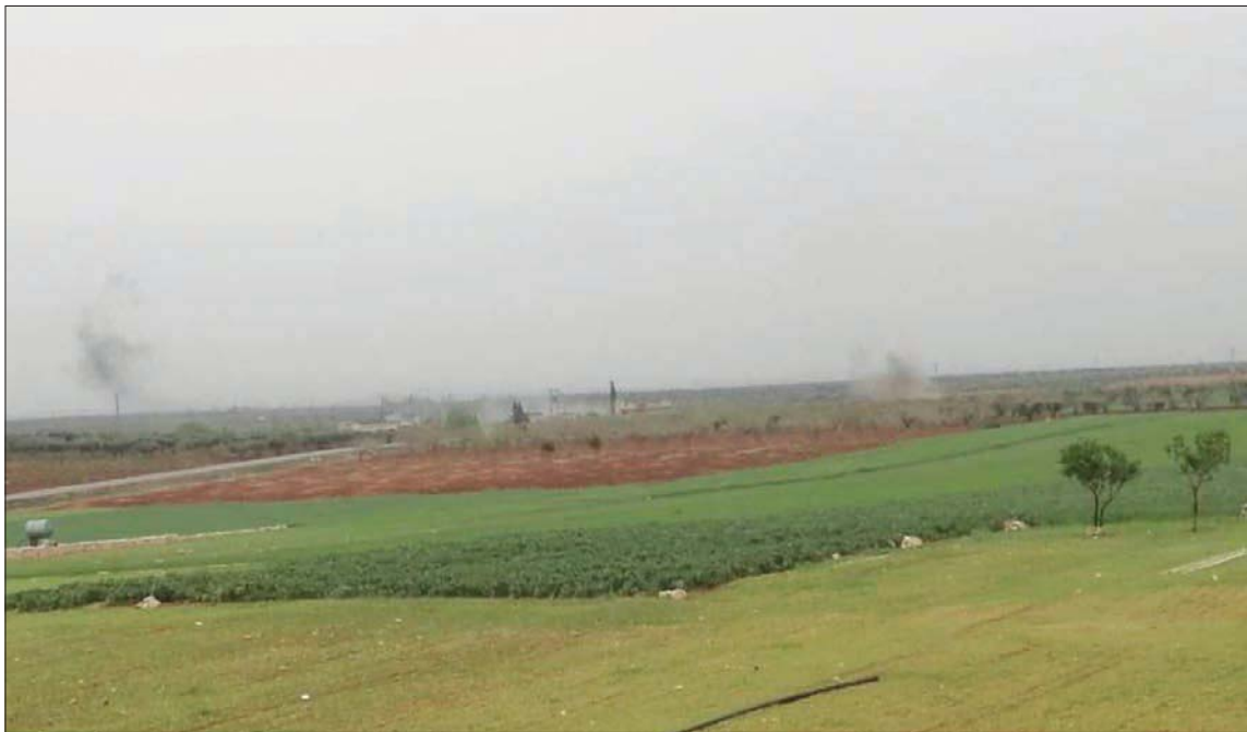
تصنف من «قوات سوريا الديمقراطية» على منطقة كلجبرين في ريف حلب

لوح الرئيس التركي رجب طيب أردوغان بتوسيع العمليات العسكرية ضد قوات سوريا الديمقراطية (قسد) على خلفية مقتل شرطي تركي في مارغ في المنطقة المعروفة بـ«درع الفرات» في الريف الشمالي لحلب، في وقت قتل عدد من عناصر «قوات سوريا الديمقراطية» (قسد) وجرح آخرون، في غارة جوية تركية في ريف حلب الشمالي، وسط تصعيد وقصف متبادل بين القوات التركية وقصائل «الجيش الوطني السوري» من جهة، و«قوات سوريا الديمقراطية» (قسد) من جهة ثانية، على خطوط التماس بين المناطق الخاضعة لسيطرة الأخيرة ومناطق القصد «غصن الزيتون» المعروفة باسم «غصن الزيتون» و«درع الفرات»، شمال غربي سوريا.