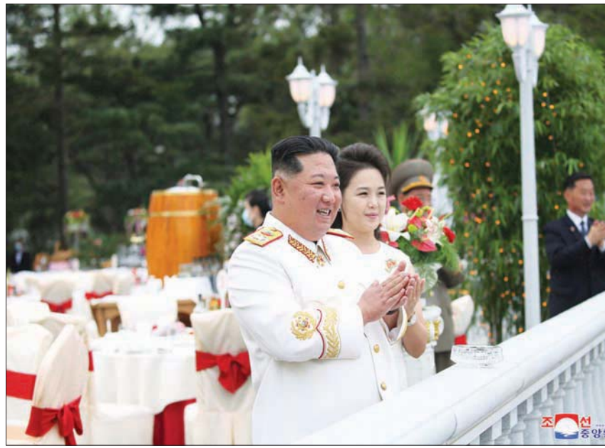
الزعيم الكوري الشمالي يستعرض حرس الشرف وبجانبه زوجته قبل العرض العسكري في بيونغ يانغ

وأشار أردوغان إلى قيام العصابات الأرمنية بارتكاب مجازر في الأناضول بدعم