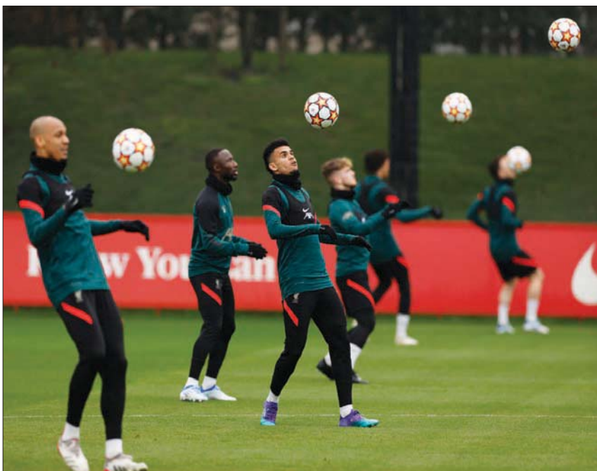
لاعبو ليفربول متحمسون لخوض نصف نهائي دوري الأبطال