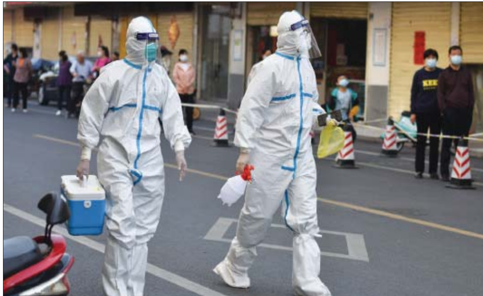
ممرضان بملابس واقية في إحدى المدن الصينية

وقد عدلت السلطات الصينية حصيلة الوفيات في ووهان في بداية الجائحة، في وقت لاحق صعوداً بنسبة 50 في المائة. وقال أستاذ علم الأوبئة في جامعة تورونتو برابات جها إن الحصيلة الإجمالية لموجة التفشي الحالية قد تكون «رقماً مرتفعاً جداً» بسبب العدد الكبير لكبار السن الذين لم يتلقوا كامل جرعات اللقاح، واللقاحات ذات نسبة الفاعلية المنخفضة. ويعزو كبير علماء الأوبئة في الصين، وو زونيو، نسبة الوفيات المنخفضة في بلاده إلى تطبيق إستراتيجية الرصد المبكر من خلال «إختبارات الواسعة النطاق». وقال يو: «إبقت حجم التفشي عند الحد الأدنى سيسمح وبشكل تام بتفادي الوفيات الناجمة عن الضغط على الموارد الطبية».