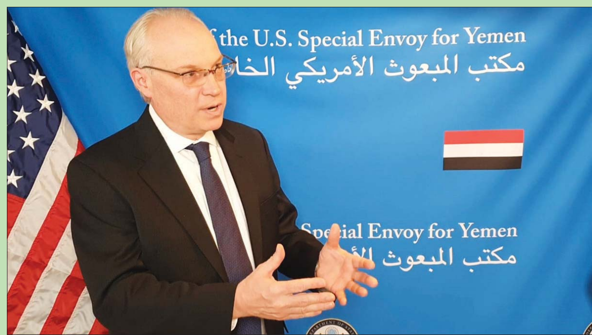
المبعوث الأمريكي لليمن متحدثاً مع «التشرق الأوسط» خلال المشاورات اليمنية - اليمنية في الرياض مطلع أبريل الحالي

على رأسها حزب المؤتمر الشعبي العام، وتجمع الإصلاح، والمجلس الانتقالي الجنوبي، غداً تغييراً كبيراً في ميزان القوى الداخلي. المنطقة، بات من الطبيعي ليس فقط تغييراً لدى اليمنيين، بل تغييراً أميركياً في مقاربة الأزمة اليمنية، عبر الإشارة إلى الجهة التي تتحمل المسؤولية عن إطلاتها، في ظل براغماتية واشنطن تأخذ في الاعتبار أن غياب الحوثيين سيكون قضيلاً، في ظل الدعم الذي تقدمه مع القوى الدولية، للجهود التي يبذلها المبعوث الأممي، لمشروع استعادة الدولة اليمنية.