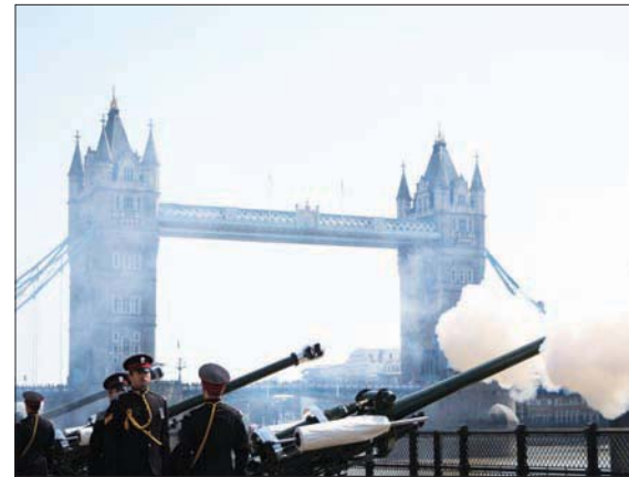
فرقة المدفعية تطلق عشرات الطلقات في «جسر البرج» بمناسبة عيد ميلاد الملكة (أ.ب.)

فبراير، لكن أعراضه كانت «خفيفة»، حسب قصر «باكنغهام». وقالت الملكة للمعالجين أخيراً: «هذه الجائحة الرهيبة تسبب بالتعب الشديد والإنهالك، ليس كذلك». وقال حفيدها هاري لشبكة «إن بي سي» الأربعة، بعد زيارة مفاجئة لقصر «ويندسور» الأسبوع الماضي، مع زوجته ميغن: «إنها في حالة جيدة، وهذه الزيارة الأولى للزوجين المقيمين حالياً في ولاية كاليفورنيا الأميركية، للملكة منذ عامين. منذ أكتوبر، أوكلت الملكة إلى حد كبير مهامها إلى ابنها تشارلز (73 عاماً) وريت العرش، لكن شعبيته لدى الرأي العام أدنى بشكل ملحوظ مقارنةً بها (43 في المائة إيجابياً، مقابل 69 في المائة للملكة)، وفق استطلاع أجراه معهد «إيبسوس» في مارس، كما أنه أقل شعبيته من