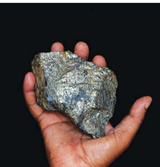
تراجع إنتاج النحاس في عدد من كبريات الشركات العالمية

وتم فرض قيود أكثر صرامة في مدينتي سوتشو وتشنغتشو، عاصمة مقاطعة هينان وسط الصين. وتصرف الصين حتى الآن على التمسك بسياسة صفر إصابات، رغم الأدلة المتزايدة على أن هذه السياسة تهدد النمو الاقتصادي. وأعلن مصنع للنحاس في هينان ينتج الأنابيب والأجزاء المستخدمة في الأجهزة المنزلية والأجهزة الطبية أن مبيعاته تراجعت بنسبة 20 إلى 30 في المائة من حيث الحمولة في النصف الأول من أبريل (نيسان) مقارنة بالفقرة نفسها العام الماضي. وصرح مسؤول في الشركة، طلب عدم كشف هويته بسبب القواعد الداخلية، بأن العديد من العملاء في مناطق بسبب القيود.