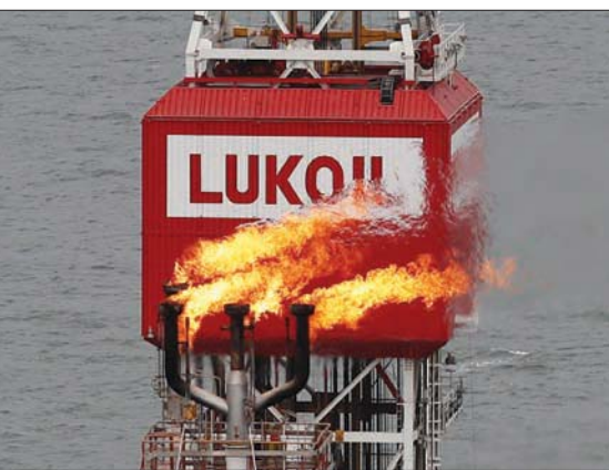
رئيس «لوك - أول»، يستقيل بشكل مفاجئ

تشغيل المشروع في 2023 وأن يصل قدرته الإنتاجية القصوى، البالغة 19,8 مليون طن من الغاز المسال سنوياً، بحلول عام 2025 أو 2026. ووفقاً لمخلسون، فقد جرى استكمال المرحلة الأولى من بناء وحدات الغاز الطبيعي المسال للشركة «نوفاتك» الروسية المنتجة للغاز، ووثيقة الصلة بالكرملين، عن تحديد موعد لبدء تشغيل مشروع الشركة للغاز المسال (أركتيك إل إن جي-2) «القطب الشمالي للغاز الطبيعي المسال» وفرضت الولايات المتحدة عقوبات عليها بسبب العقوبات الغربية. وقال مخلسون، يوم الخميس في اجتماع سنوي، «في ظل التحديات غير المسبوقة، تعمل نوفاتك على تحديد الموعد والتصورات العامة للمشروع». وأقر بأن الالتزام بالإطار الزمني الذي كانت الشركة قد حددته سيكون صعباً. وكان من المفترض أن يبدأ