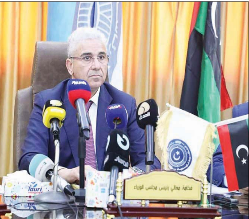
صورة لفتحى باشاغا مترئساً اجتماع حكومته نشرتها صفحة داعمية في «فيسبوك» أمس

وكان المجلس الأعلى للدولة، أوصى ممثليه في اجتماع القاهرة بتقديم تقرير تفصيلي حول «الصعوبات والعراقيل والحلول المقترحة لإنجاح المسار الدستوري، قبل اتخاذ المجلس التوصيات والتوجيهات اللازمة لإنجاز قاعدة دستورية متينة تؤدي إلى انتخابات شفافه بشكل عاجل».