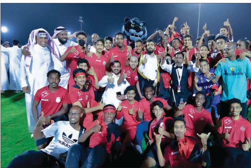
رئيس نادي الرياض خلال مشاركته أعضاء الفريق فرحة الصعود

وكان الاتحاد السعودي لكرة القدم قد أقر رفع عدد فرق دوري المحترفين في الموسم بعد المقبل لـ18 فريقاً، حيث ستصعد من دوري الأولى الموسم المقبل 4 فرق دفعة واحدة، وللمرة الأولى مقابل هبوط فريقين للثانية، وهذا الرقم المحدد للصاعد قد يرفع وتيرة المنافسة أكثر في دوري الأولى مع وجود 6 محترفين بجانب في هذا الدوري، حيث تسعى الأندية العربية خصوصاً إلى استعادة أجادها بالوجود في أقوى دوري في منطقة الشرق الأوسط.