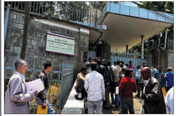
إثيوبيون خارج سفارة روسيا في أديس أبابا الثلاثاء

أديس أبابا، «الشرق الأوسط» يقف إثيوبيون في طوابير في وقت مبكر صباح كل يوم أمام السفارة الروسية في أديس أبابا، فيدع رواج إشاعات على مواقع التواصل الاجتماعي عن أجر كبير وفرصة عمل بعد الحرب، تدفق العشرات، بينهم شبان وكبار سن، وكثير منهم يحمل في يده شهادته العسكرية، على أمل التطوع للقتال إلى جانب روسيا في أوكرانيا، وفق ما ذكر تقرير لوكالة «رويترز». وقال اثنان من سكان الحي الذي توجد فيه السفارة إن أعداد المتطوعين كانت قليلة في بادئ الأمر، لكنهم أصبحوا بالعشرات بعد أسبوعين. ويوم الثلاثاء، نقلت «رويترز» تقديم عدة مئات من الرجال بيئاتهم لحراس أمن إثيوبيين خارج السفارة بعد أن طلبوا منهم إبراز شهاداتهم العسكرية، وليس هناك ما يدل على إرسال أي إثيوبيين إلى أوكرانيا للقتال، أو أن أيًا من هؤلاء أصبحوا سيذهب بالفعل إلى هناك. وقال رجل خرج من السفارة وتحدث إلى المتطوعين بالروسية عبر مترجم، إن روسيا لديها ما يكفي من القوات الآن لكن سيتم الاتصال بهم إذا دعت الحاجة إليهم. وأصدرت السفارة بياناً في وقت لاحق يوم الثلاثاء،