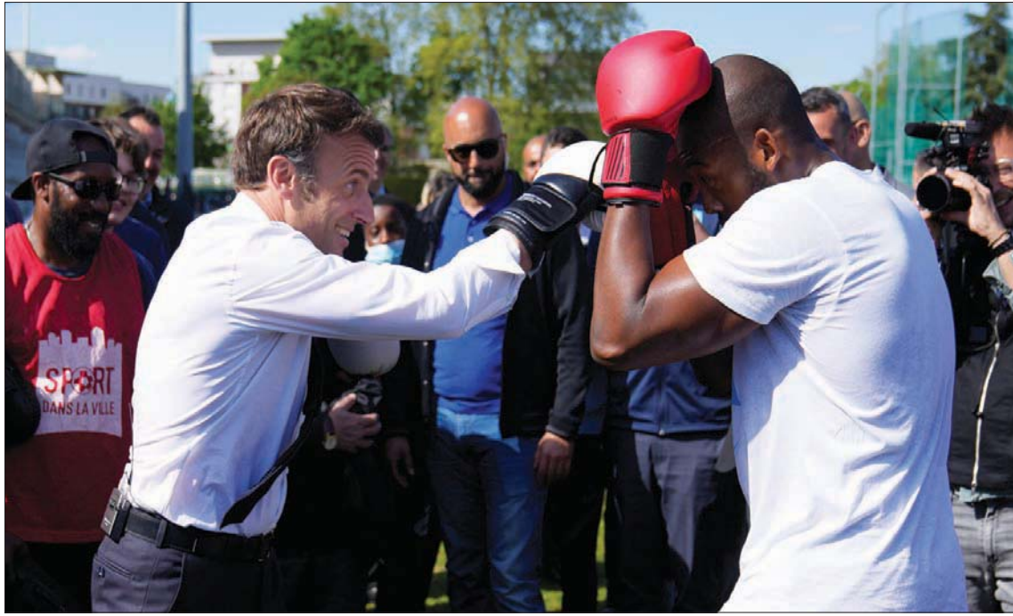
إيمانويل ماكرون يلاكم استعراضياً خلال وقفة انتخابية في ملعب رياضي بضواحي باريس أمس

وذلك بعيداً عن مزيد من الاندماج الذي يريده ماكرون الذي يرى أن المطلوب «إصلاح الاتحاد الأوروبي وليس الخروج منه». ولم يتنرد ماكرون في اتهام منافسته بـ«الكذب» على الناخبين لأن رغبتها الحقيقية التي لا تجرؤ على التعبير عنها علناً تبقى الخروج من الاتحاد. وردت لوين بأنها تريد البقاء في الاتحاد، ولكن مع تعديله، إذ «لا توجد سيادة أوروبية لأنه لا يوجد شعب أوروبي». وتريد لوين تنظيم استفتاء لتعديل الدستور الفرنسي من أجل أن ينض على تقدم القوانين الفرنسية على الإصلاحات الأوروبية وتضمينه كذلك مبدأ «الأولوية الوطنية» الذي من شأنه أن يمنح الأولوية للفرنسيين في الحصول على سكن اجتماعي أو تقديمات اجتماعية مختلفة. وثمة من يوافق ماكرون الرأي لجهة اعتبار أن ما تسعى إليه لوين يمكن عده خروجاً مقنعاً من الاتحاد. يضاف إلى ذلك أن هذه التعديلات تتعارض مع المعاهدات الأوروبية. وعهد ماكرون إلى تنفيذ وانتقاد خطة منافسته منوهاً بحاجة فرنسا لأوروبا، ونسند بدعوتها إلى خفض مساهمة فرنسا في الميزانية الأوروبية. ورأى الرئيس الحالي أن لا تعارض بين السيادة الفرنسية والأوروبية اللتين يتعين تعزيزهما، مشيداً بما تحقق على المستوى الأوروبي في مواجهة جائحة «كوفيد - 19» وبعثاته الاقتصادية والاجتماعية.