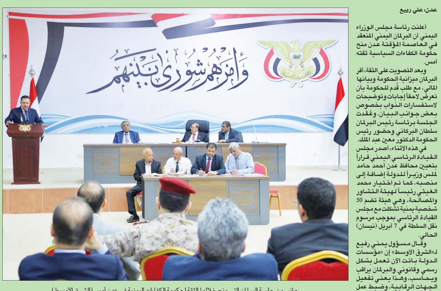
عدن، علي ربيع أعلنت رئاسة مجلس الوزراء اليمني أن البرلمان اليمني المنعقد في العاصمة المؤقتة عدن منح حكومة الكفاءات السياسية ثقة أمس.

ويعد التصويت على الثقة، أقر البرلمان ميزانية الحكومة وبياناتها المالي، مع طلب قدم للحكومة بأن تعرض لاحقاً إجابات وتوضيحات لاستفسارات النواب بخصوص بعض جوانب البيان. وعقدت الجلسة برئاسة رئيس البرلمان سلطان البركاني وحضور رئيس الحكومة الدكتور معين عبد الملك. في هذه الأثناء، أصدر مجلس القيادة الرئاسي اليمني قراراً بتعيين محافظ عدن أحمد حامد لملس وزيراً للدولة إضافة إلى منصبه، كما تم اختيار محمد الغيثي رئيساً لهيئة التشاور والمصالحة، وهي هيئة تضم 50 شخصية يمنية تشكلت مع مجلس القيادة الرئاسي بموجب مرسوم نقل السلطة في 7 أبريل (نيسان) الحالي.