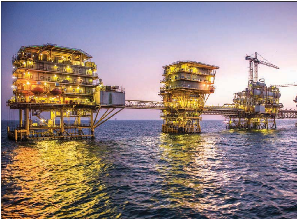
السعودية توسع استخدامات الذكاء الصناعي في عمليات الطاقة والتنقيب

كعلوم البيانات، والذكاء الصناعي، وإنترنت الأشياء، والأمن السيبراني. وتشارك الهيئة السعودية للبيانات والذكاء الصناعي «سدنيا» في المؤتمر ضمن جلسة حوارية، بجانب الهيئة العامة للمنشآت الصغيرة والمتوسطة «منشآت» لإبراز دور الشركات الصغيرة والمتوسطة التقنية، الذي سيضم جهات حكومية عدة وشركات خاصة كبرى، لإتاحة الفرصة لعدد من الشركات الناشئة ورواد الأعمال المهتمين للمشاركة في هذا المحفل. واهتمت المملكة بترقية العديد من القطاعات الحيوية من بينها قطاع النقل والمواصلات الذي شهد نقلة نوعية في مرحلة التحول التكنولوجي، الذي يخدم توجه المملكة في تقديم الابتكارات وتفعيل الحلول التقنية لتحسين الأداء، وتخفيض التكاليف، والتسهيل على المستخدمين؛ ليصبح قطاع النقل أكثر ذكاءً وفاعلية. ويسهم التحول الرقمي في تحسين العمل في قطاع النفط والبتروكيماويات السعودي، حيث تبرز «أرامكو» السعودية من خلال مصنع يعمل به مجموعة من علماء البيانات والخبراء في تعلم الآلات، مستفيدين من ثروة البيانات الهائلة القائمة على الذكاء الصناعي وتقديم الفوائد المتعلقة بالبيئة والسلامة في مراحل سلسلة قيمة الطاقة، وكذلك استخداماتها في قطاعي التنقيب والإنتاج.