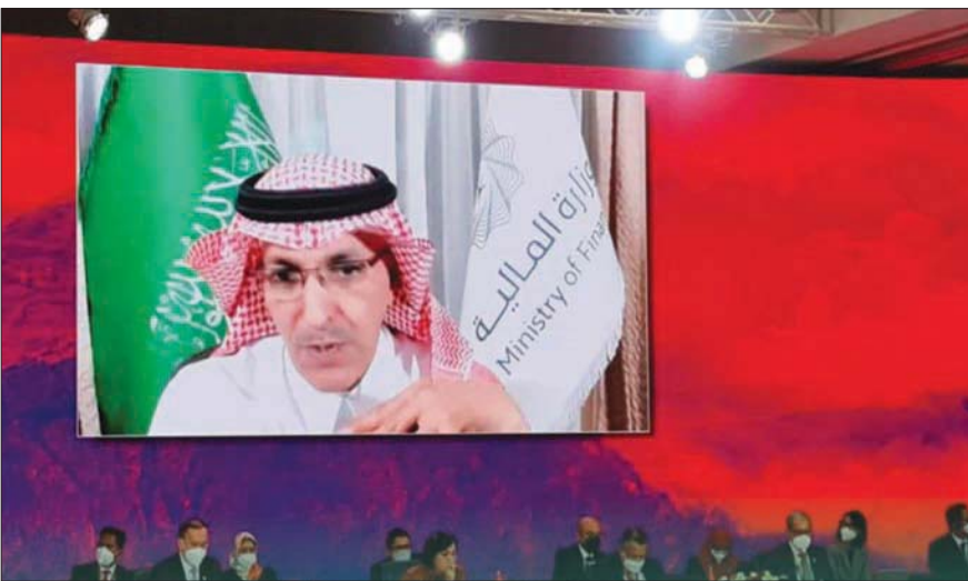
وزير المالية السعودي خلال الاجتماع الثاني لوزراء المالية ومحافظي البنوك المركزية لمجموعة العشرين في واشنطن

وناقش الاجتماع أبرز المسائل المتعلقة بالتغيرات المهمة في التوقعات الاقتصادية العالمية منذ اجتماع فبراير (شباط) الماضي، بما في ذلك الآثار الاقتصادية والمالية اللازمة في أوكرانيا، والية الوقاية من الأوبئة والتأهب والاستجابة لها، بالإضافة إلى الجهود المستمرة لتخفيف تأثير توجبه حقوق السحب الخاصة، وتسلمت جمهورية إندونيسيا رئاسة مجموعة العشرين في 2021 بعد اختتام قمة القادة في روما تحت الرئاسة الإيطالية، وتضمنت أولويات الرئاسة الإندونيسية ركائز