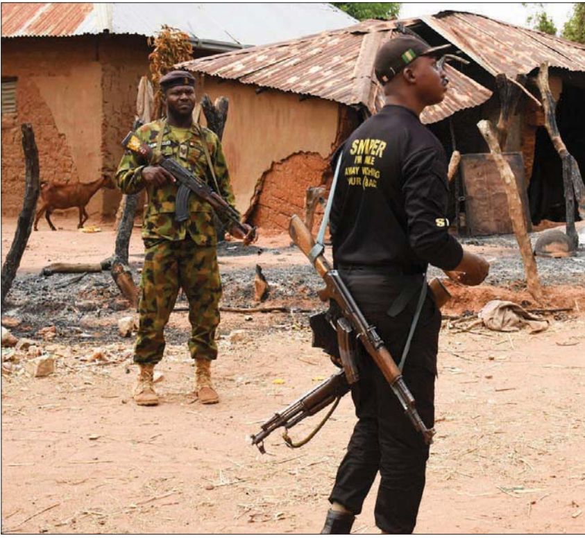
حراسة قرية كوكوا في ولاية بلاتو النيجيرية بعد هجوم أحرقت فيه «داعش» منازل السكان بداية الشهر