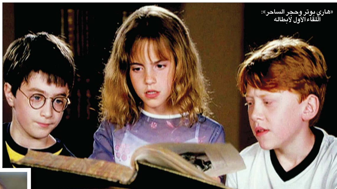
«هاري بوتر وحجر الساحر»: اللقاء الأول لأبطاله

وكان من المفترض أن ينجز «فانتاستيك بيستس: أسرار ديمبلور» ضعف ما أنجزه في أسبوعه الأول هذا، أكثر من ذلك، أن حصلت الكاتبة على نحو مليون دولار عن ذلك العقد الرباعي. لاحقاً ضاعفت الكاتبة أجرها ومع نهاية الجزء الثامن كانت ثروتها تقدر، حسب مجلة فوربس، بمليار دولار. اهتم المخرج ستيفن سبيلبرغ بتحقيق الجزء الأول على الأقل. قضت خطة في الواقع شراء حقوق الرواية الأولى وحدها وإنتاج وإخراج فيلم يكون بمثابة تجربة. لكن رولينغز، التي كانت تمسك بزمام الأمور وبقيت تتصرف على كل التفاصيل حتى النهاية، لم توافق على خطط سبيلبرغ التي قضت، فيما قضت، تحقيق فيلم أميركي في تعميم الأحداث لكي تتحول إلى تقليد هوليوودي فقط، بل أصرت على الطابع الإنجليزي لكل شيء بما في ذلك الممثلين.