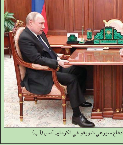
بوتين لدى اجتماعه مع وزيره للدفاع سيرغي شويغو في الكرملين أمس