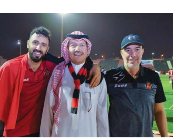
رئيس نادي الرياض خلال مشاركته أعضاء الفريق فرحة الصعود

للرياض ضد الترجي حضوراً كبيراً من الرياضيين، وأبرزهم فهد بن نافل رئيس الهلال، وعدد كبير من النجوم السابقين، بمن فيهم اللاعبون الدوليون، حيث