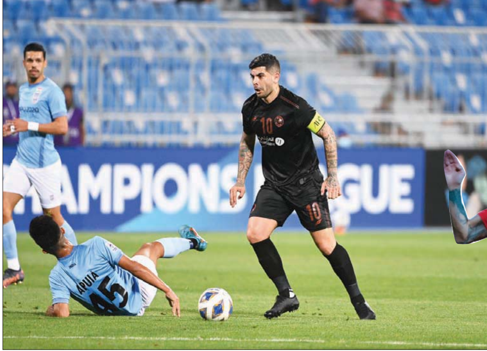
بانينغا يسعى لقيادة الشباب إلى دور الـ16 الآسيوي عبر شباك مومباي الهندي

وفي المجموعة ذاتها يواجه سيباهان أصفهان الإيراني نظيره باختاخور الأوزبكي في مواجهة يسعى منها الفريقان إلى تحقيق الفوز من أجل المنافسة على البطولة الثانية لهذه المجموعة، وهو الأمر الذي يتطلب تعثر التعاون في المباراتين المقبلتين أمام الدحيل وبختاخور الأوزبكي.