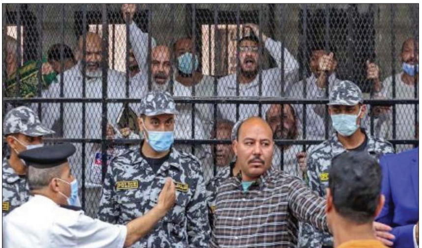
المتهمون داخل قفص الاتهام في جلسة إعلان الحكم أمس

تحقيقات النيابة، «فحص ومشاهدة هواتفهم وأجهزة المتهمين وما تضمنته من مقاطع مرئية وصور لقطع أثرية ومواقع للحفر ومعدات جرت بيدهم بشأنها، إلى جانب ما انتهت إليه اللجنة الفنية المشكلة من المجلس الأعلى للأثار من فحص القطع الأثرية المضبوطة، ومشاهدة المقاطع المرئية والصور المشار إليها بهواتف المتهمين، وما ثبت بتقرير اللجنة المشكلة من منطقة آثار مصر القديمة من معاينتها مواقع الحفر وفحص الأدوات والآلات المضبوطة». والمدانون الذين قضت المحكمة بمعاقبتهم بالسجن