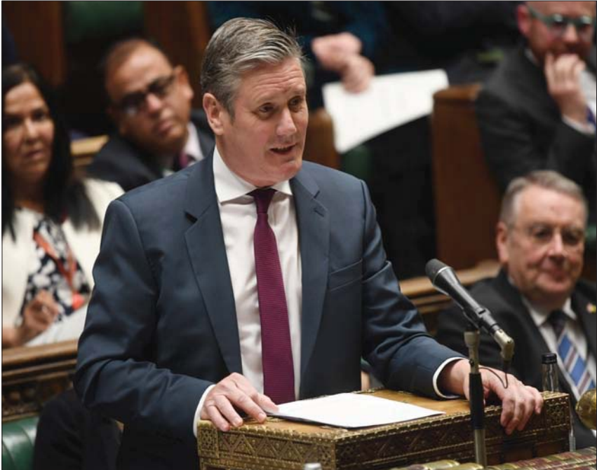
زعيم المعارضة العمالية كير ستارمر خلال مسالة جونسون في مجلس العموم أول من أمس (د.ب.أ)

في هذا الفصل الجديد من هذه القضية التي شهدت كشف معلومات جديدة ودعوات للاستقالة واعتذاراً علنياً، قرر النواب بالتوافق، ومن دون تصويت رسمي، تكليف اللجنة الامتيازات، في البرلمان التحقيق في الفضيحة، في إجراء من شأنه أن يدفع في نهاية المطاف جونسون إلى الاستقالة. ودفع توتير ساد قبيل الجلسة، الحكومة إلى العدول عن مناورة لتأجيل التصويت، وأي توصيات للتصويت قبل دقائق من بدء النقاش. وقال زعيم المعارضة العمالية كير ستارمر: «نعلم أن رئيس الوزراء خالف القانون، مؤكداً أن رئيس الحكومة ليس بمنأى عن غرامات جديدة لمشاركته في احتفالات أخرى، حسبما أوردت وكالة الصحافة الفرنسية. كما فرضت على جونسون غرامة لمخالفته قيود مكافحة