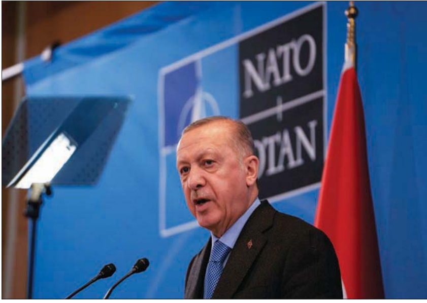
إردوغان يتحدث في مؤتمر صحفي عقب قمة استثنائية لـ«الناتو» في بروكسل، 24 مارس الماضي

الوضع في أوكرانيا. وأضافت: في بيان: «شدد الجانب الروسي مجدداً على أن المسؤولية الكاملة عن الوضع الإنساني المعقد في مناطق القتال تقع على عاتق الكتائب القومية اليمينية المتطرفة الأوكرانية التي تستخدم المدنيين دروعاً بشرية، وتمنعهم من الانسحاب عبر الممرات الإنسانية التي يوفرها العسكريون الروس بانتظام». وأضاف البيان أن الوزيرين ناقشا الخطوات المشتركة الممكن اتخاذها على مستوى وزارتي الخارجية ووزارتي الدفاع بهدف ضمان أمن المدنيين، خصوصاً الأجانب، في أوكرانيا. و بشأن المفاوضات بين روسيا وأوكرانيا، ذكر البيان أنه جرى التأكيد على ثبوت الموقف التركي، في بيان، أن الروسي، الذي يقضي بأن نتيجة المفاوضات تتوقف بالكامل على استعداد كيف لتلبية مطالب موسكو المشروعة، واستضافت تركيا جولتي تفاوض بين روسيا وأوكرانيا في مدينتي أنطاليا