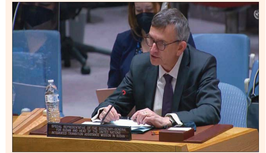
فولكر بيرترس رئيس بعثة الأمم المتحدة «يونيتامس» في السودان

الخرطوم؛ أحمد يونس أصبحت تحت المختصر «يونيتامس» بناء على طلب الحكومة السودانية في يونيو (حزيران) 2020، ووفقاً لقرار مجلس الأمن 2524 لدعم الانتقال السياسي في السودان لمدة عام، وتم تجديد مهمتها في يونيو 2021 لمدة 12 شهراً إضافياً حتى 3 يونيو 2022. وعقب الإجراءات التي اتخذها القائد العام للجيش عبد الفتاح البرهان في 25 أكتوبر (تشرين الأول) 2021، وعلق بموجبه بعض نصوص الدستور الانتقالي وأعلن حالة الطوارئ، وحل الحوكمة بمجلسها السياسي والوزراء، توترت العلاقات بين السلطات العسكرية الحاكمة و«يونيتامس» بصورة حادة. تعد هناك رئيس مجلس السيادة القائد العام للجيش مطلع أبريل (نيسان) الجاري بطرد الممثل الخاص للأمم المتحدة فولكر بيرترس، بسبب ما وصفه «التدخل» في شؤون البلاد و«تجاوز صلاحيات تفويضه، وذلك بعد إحاطة التي قدمها رئيس البعثة ممثل الأمين العام فولكر بيرترس لمجلس الأمن الدولي التي لم ترض الرجل الذي أطاح بشركائه المدنيين واستولى على الحكم.