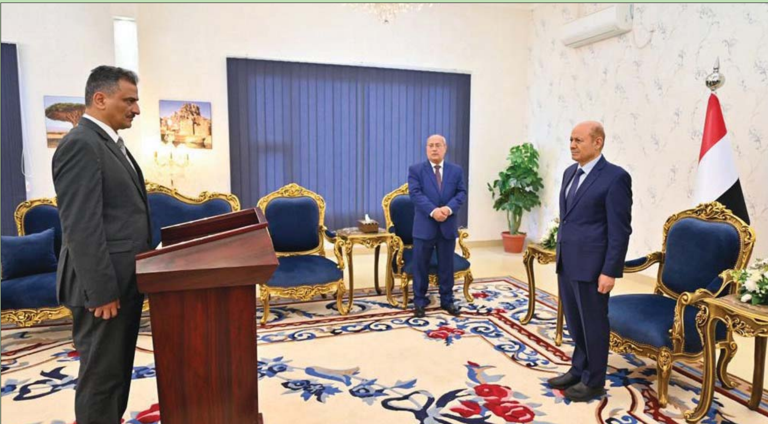
أحمد لى لدى تأديته مراسم أداء القسم أمام الدكتور رشاد العليمي في عدن أمس (سبأ)

لمشروع الموازنة بمبلغ 3 تريليونات و645 مليار ريال، بعجز مقداره 401 مليار ريال (الدولار نحو 800 ريال في المناطق المحررة). تحركات القيادة اليمنية الجديدة ممثلة بالمجلس الرئاسي إلى جانب بقية المؤسسات والأجهزة الحكومية، تزامنت مع استمرار الخروق الحوثة للهيئة الأممية، حيث اتهم الجيش الجماعة الانقلابية بارتكاب 80 خرقاً في يوم الثلاثاء الماضي، في جهات الأمانة العامة للهيئة الأممية، يقول المبعوث الجديد وتزع الصالح. هذه الخروق التي بلغت قريباً من 2000 خرق وفق إحصاء الجيش اليمني منذ بدء سريان الهدنة مطلع الشهر الحالي، يقول المبعوث الأممي، إنها لم تؤثر على الموارد العامة لمشروع الموازنة العامة للدولة للسنة المالية 2022 بمبلغ 3 تريليونات و243 مليار ريال، وقدرت جملة الاستخدامات العامة