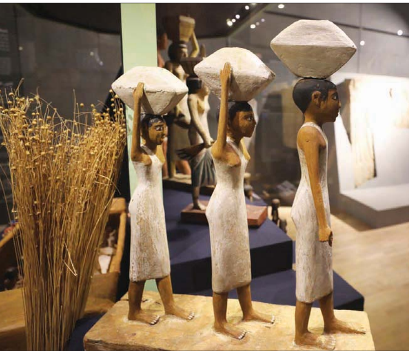
افتتحت مصر أمس موسم الحصاد مع إعلان عن استراتيجية متعددة المحاور لمواجهة أزمة الغذاء العالمية

هامش اجتماعات الربيع لصندوق النقد والبنك الدوليين واجتماع وزراء المالية ومحافظي البنوك المركزية لمجموعة العشرين تحت الرئاسة الإندونيسية. وتمت مناقشة العلاقات الاقتصادية الثنائية بين البلدين، إلى جانب أبرز الجوانب الاقتصادية الناجمة عن التطورات الجيوسياسية وجائحة فيروس كورونا