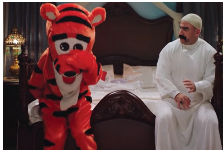
«الكبير أوي» يلقي تفاعلاً جماهيرياً