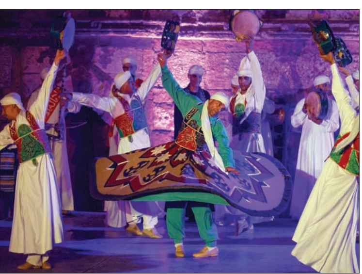
فرقة مصرية تؤدي رقصة التنورة التقليدية خلال رمضان في القاهرة