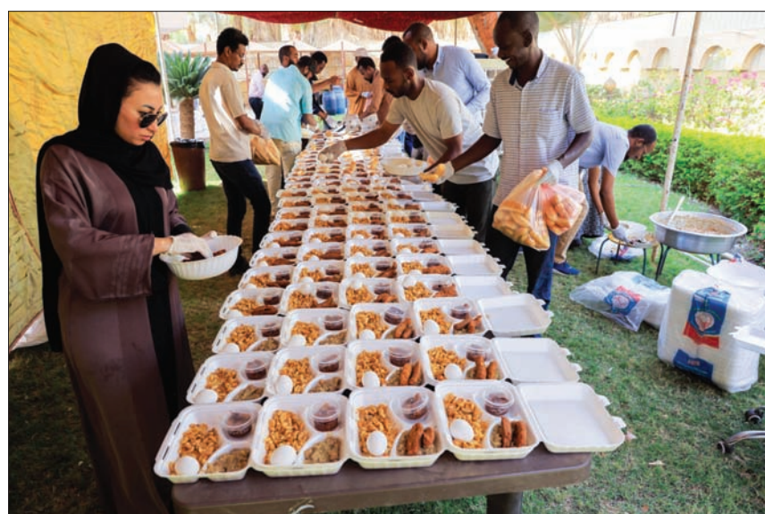
متطوعون شباب يحضرون وجبة إفطار رمضان في الخرطوم

الذرة، ويتم إضافة «الملاح»، الذي ينوع بين «الويكة» أو ملاح الروب الأبيض، أو ملاح «التعجيمية»، وهنالك من يفضلون على الإفطار وجبة «القراصنة» بالمدعة (الصوص).