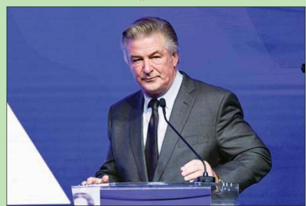
الممثل أليك بالدوين خلال حفل

موفي بروداكشنز» ستيفان فريدمان، في بيان إن المنتجين يعتزّمون الطعن بالتقرير. وكتب: «بينما نقدّر الوقت والجهد الذي بذلته هيئة البيئة... نختلف مع النتائج التي توصلت إليها وبنوحي الاستئناف». ورفعت عائلة هالينا هتيشينز دعوى قضائية ضدّ البك بالدوين ومنتجي الفيلم، كما زُفعت دعوى مدنية أخرى. وقال أليك بالدوين إنه تتبّع من المسؤولين في موقع التصوير المدسّس الذي استخدمه لا يحتوي على ذخيرة حية، وأن الضحية هالينا هتيشينز طلبت منه أن يصبّوب في اتجاهها، وأنه لم يضغط على الزناد عند انطلاق العيار الناري القاتل. وقال في ديسمبر (كانون الأول) الماضي: «لدي شعور بأن شخصاً ما مسؤول عما حدث، ولا أعرف من هو. لكنني لست المسؤول».