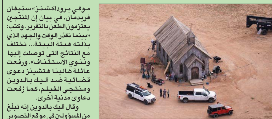
موقع تصوير الفيلم في إحدى مزارع سانتا في نيو مكسيكو