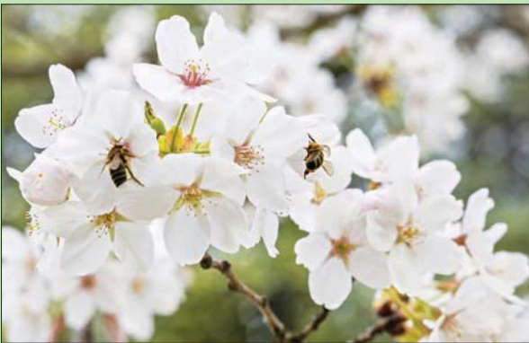
يجمع النحل حبوب اللقاح في أزهار شجرة الكرز في جنيف

لندن: «الشرق الأوسط» حذرت أبحاث علمية من الأضرار المحتملة على تلقيح النباتات وعلى النظم البيئية بأكملها، ومن أن أزمة المناخ قد تؤدي إلى ظهور المزيد من النحل بأجسام صغيرة ولكن بعدد أقل من النحل الطنان، حسب صحيفة (الغارديان) البريطانية.