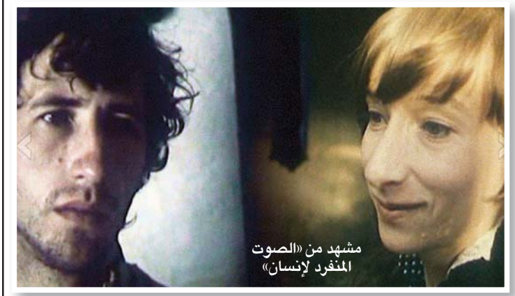
مشهد من «الصوت المنفرد للإنسان»