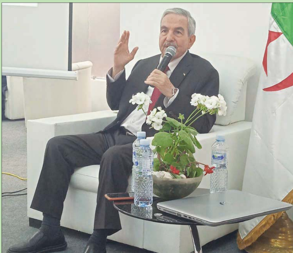
صالح بلعيد رئيس «المجلس الأعلى للغة العربية» في الجزائر

وأضاف صالح: «في وقت مضى، وجدت محاولات لتدريس الفرنسية في الأولى ابتدائي، بدل الرابعة. وفشل المسعى. وهي حالياً في السنة الثانية. كما أن الخطاب السياسي جعل العربية سهلاً فارغة من أي قيمة معنوية. كما لم ينظر بعين الجدية إلى مرحلة التعليم الثانوي، ففيها تُعدّ كفاءات وطنية لمرحلة البحث والجامعة، ويستفاد من التعددية اللغوية. نحن خططنا للأسف للغة واحدة وهي الفرنسية. فغير معقول أن ننظر التطور، الذي يحصل في ميدان ما بلغة أجنبية، فنترجمه إلى الفرنسية. وبعدنا إلى العربية، والترجمة خيانة كما هو معلوم. فالخطاب لا يصل سليماً عندما يكون ترجمة على ترجمة».