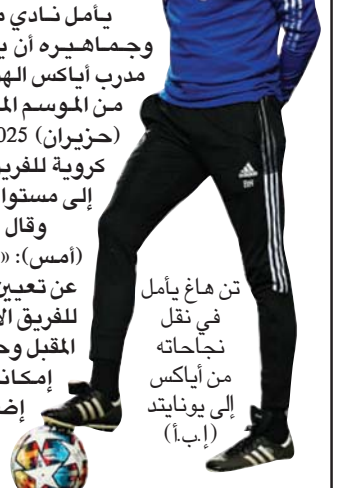
تن هاغ يأمل في نقل نجاحاته من إياكس إلى يونايتد