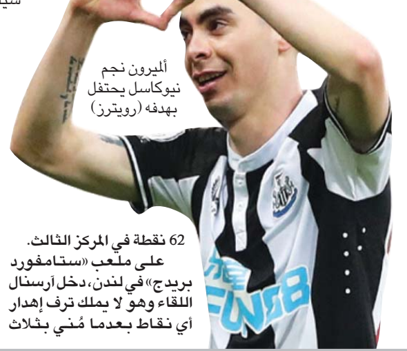
الميرون نجم نيوكاسل يحتفل بهدفه