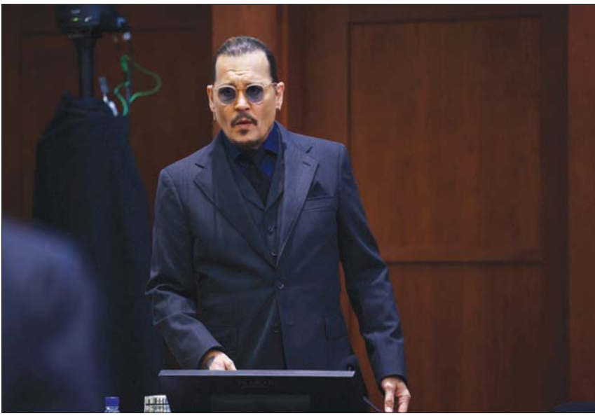
الممثل جونى ديب

وحاول ديب في الساعات الأولى من شهادته إقناع هيئة المحلفين بأن أمبير هيرد هي التي كانت تعنفه، قائلاً: «عندما كانت تشعر السيدة هيرد بالإحباط والغضب كانت تلجأ إلى الضرب»، وأشار إلى أن العنف: «يمكن أن يبدأ بصفعة أو دفعة، مضيئاً: «العنف».