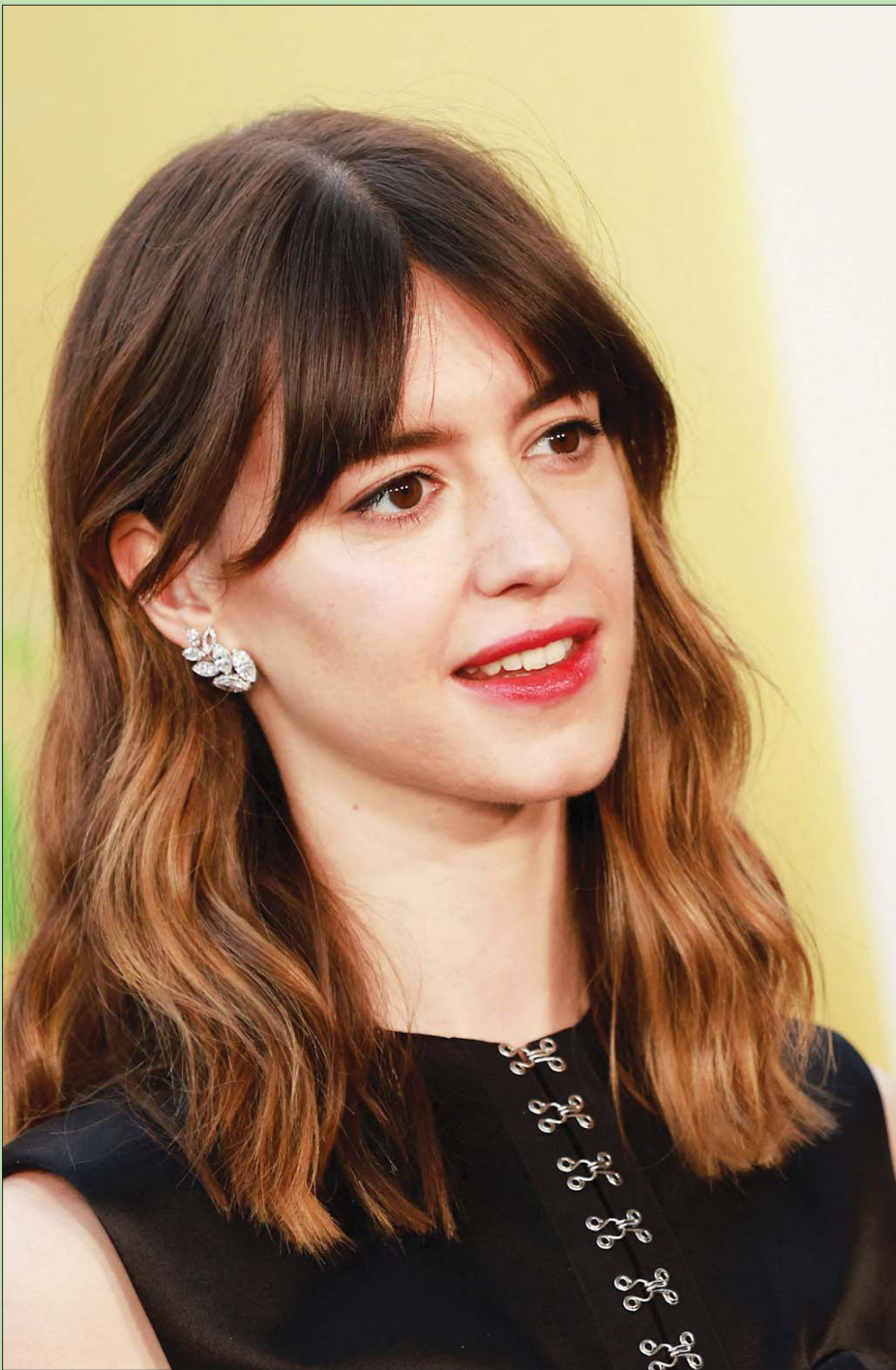
الممثلة البريطانية دايزي ادجر - جونز حضرت العرض الأول لفيلم «تحت راية السماء» في لوس أنجلوس بولاية كاليفورنيا (أ.ف.ب)

المراء قوله، ثانياً، إن القول بنهاية هذه الجماعات وتسيفه البحث فيهم ونهجم، مرهه إمّا الجهل، وهذه مصيبة، أو التجاهل، والمصيبة أعظم.