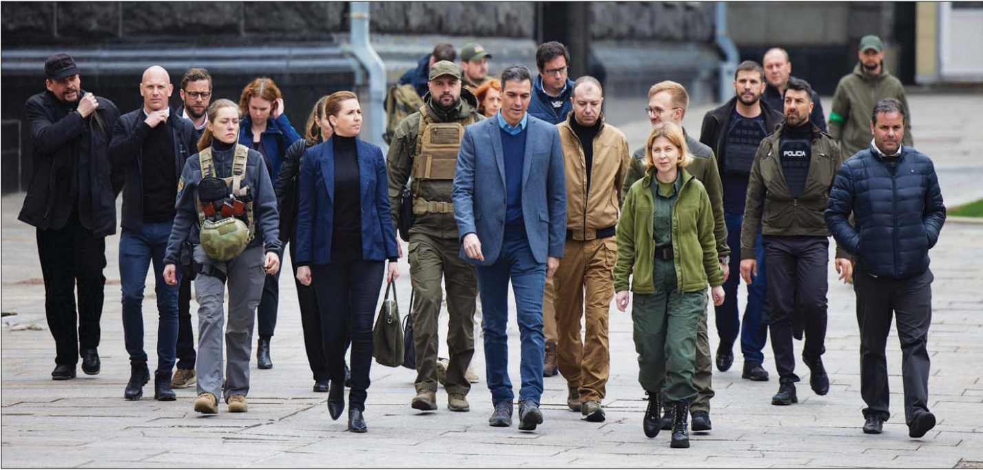
رئيس وزراء إسبانيا ونظيره الدنماركية لدى توجههما لعقد اجتماع مع زيلينسكي في كيف أمس (أ.ب)

تقديم المساعدات العسكرية والإنسانية إلى أوكرانيا. ورد الرئيس الأوكراني شاكراً الدعم الأوروبي لبلاده، مؤكداً أن «النصر بات وشيكاً ضد الاعتداء الروسي إذا توفرت المساعدات اللازمة بسرعة». في غضون ذلك، ما زال الموقف الألماني الراض إدرج النفط والغاز ضمن العقوبات الغربية المفروضة على روسيا والمماثل في مد القوات المسلحة الأوكرانية بأسلحة ثقيلة، يفكر برلين الأوروبيين والغربيين، فضلاً عن الاستعدادات السلطات الأوكرانية التي أعربت عن خيبة أملها من موقف المستشار الألماني أولاف شولتس. وكان رئيس «المجلس الأوروبي» شارل ميشال تحاشي مساء الأربعاء، التعليق على هذا الموضوع خلال المؤتمر الصحفي المشترك الذي عقده مع الرئيس الأوكراني في كيف، مكتفياً بالقول: «أنا على قناعة تامة بأن العقوبات الأوروبية ستشمل إمدادات النفط والغاز من روسيا عاجلاً أم آجلاً»، مشيراً إلى أنه «رغم الجهود التي يبذلها الكرملين للتفجوة بين الشركاء الأوروبيين، تمكنت الدول الأعضاء من الاتفاق بالإجماع على 5 حزم من العقوبات ضد روسيا حتى الآن، وعلى إرسال أسلحة إلى دولة ثالثة لأول مرة منذ تأسيس «الاتحاد». وأكد أن «روسيا لن تتمكن من تدمير