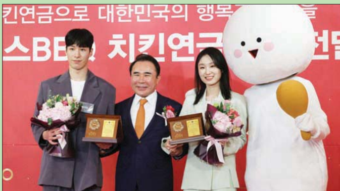
الفائزان بميداليات ذهبية يحصلان على دجاج مقلي

على الدجاج المقلي مجاناً حتى يبلغان 60 عاماً. وقالت سلسلة مطاعم «جينيسيس باربيكيو» إن الرياضيين سيحصلان على قسائم بقيمة 30 ألف وون (24 دولاراً) لإنفاقها في متجر كل يوم، مضيفة أن المبلغ سيرتفع إذا ارتفعت الأسعار. ولفتت إلى أن الحاصلين على ميداليات فضية سيحصلون على قسمة مرتين في الأسبوع لمدة 20 عاماً، وعشرة أعوام لمن ظفر بالبرونزية.