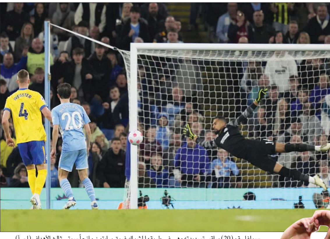
سيلفا رقم (20) يراقب تسديده وهي في طريقها لشباك فريق برايتون مانحاً سيتي ثالث الأهداف

استعاد مانشستر سيتي حامل اللقب صدارة الدوري الإنجليزي لكرة القدم من مطارده المباشر ليفربول بفوزه على ضيفه برايتون 3 - 0 صفر، فيما أشعل أرسنال الصراع على مركزين في دوري أبطال أوروبا بانتصاره على تشيلسي 4 - 2 بينما أكد نيوكاسل أنه في المسار الصحيح بفوز ثمين على كريستال بالاس 1 - 0 صفر وذلك ضمن مجموعة من مؤجلات الدوري الإنجليزي. فبعد اعتلاء ليفربول الصدارة بأربع وعشرين ساعة إثر فوزه الكبير على مانشستر يونايتد برباعية نظيفة، استعادها سيتي بفارق النقطه الواحدة بفوزه على برايتون بثلاثية نظيفة.