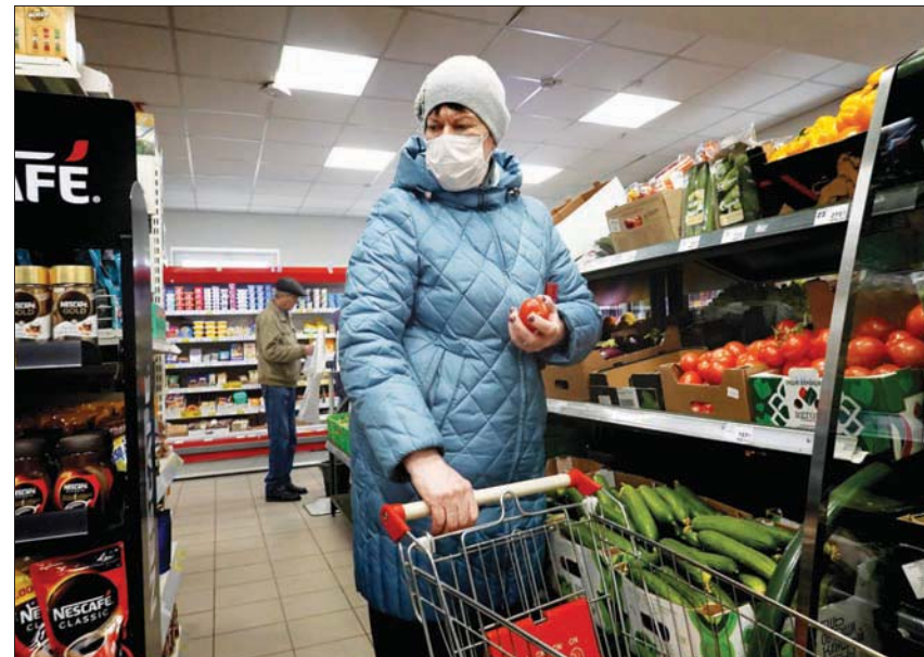
يسمح هدوء معدل التضخم الأسبوعي لـ«المرکزي» الروسي بحرية أكبر في التدخل (إ.ب.أ)

لاحق على ترشيح نابيولينا لولاية جديدة. وفي غضون ذلك، قالت وزارة الاقتصاد الروسية، يوم الأربعاء، إن التضخم السنوي في روسيا قفز هذا الأسبوع إلى 17,62 في المائة، وهو أعلى مستوى منذ أوائل عام 2002. وشهدت أسعار كل شيء تقريباً، من الخضراوات والسكر إلى الملابس والهواتف الذكية، زيادات حادة في الأسابيع القليلة الماضية بعد أن بدأت روسيا في 24 فبراير (شباط) ما تسميه «عملية عسكرية خاصة» في أوكرانيا. لكن بيانات من هيئة