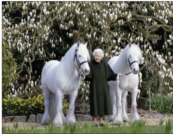
الملكة تتوسط مهيرين من نوع «فيل» المتاصل بحقائق «ويندسور»