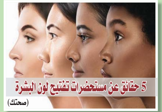
5 حقائق عن مستحضرات تفتيح لون البشرة (محتك)