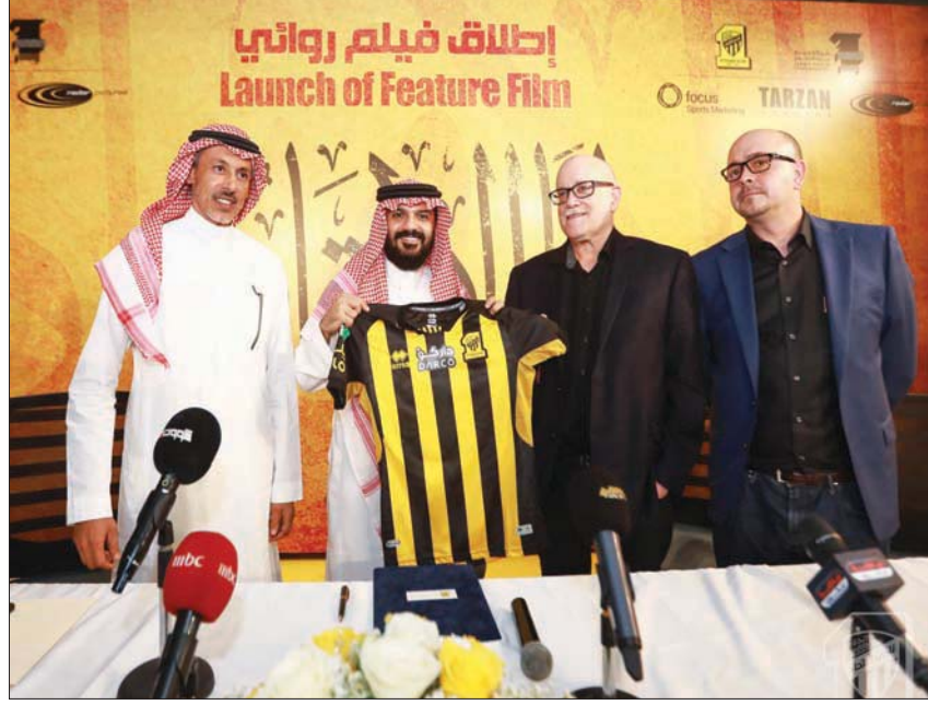
الحائلي وقزاز والمنتج العالمي تيد فيلد خلال الإعلان عن فيلم الاتحاد

كذلك، أبرم نادي مانشستر سيتي الإنجليزي، اتفاقاً مع شركة «أمازون» الأميركية للإنتاج السينمائي، وذلك لإصدار فيلم وثائقي عن كواليس غرف خلع الملابس داخل بطل البريميرليج موسم 2018-2019، وطرحت شركة «أمازون» الفيلم الوثائقي عن غرف خلع الملابس في مانشستر سيتي، بعنوان «كل شيء أو لا شيء»، والذي حاز نجاحاً كبيراً داخل إنجلترا وخارجها. وأعلنت منصة «أمازون برايم فيديو» في وقت سابق، إطلاق سلسلة أفلام وثائقية من ضمن