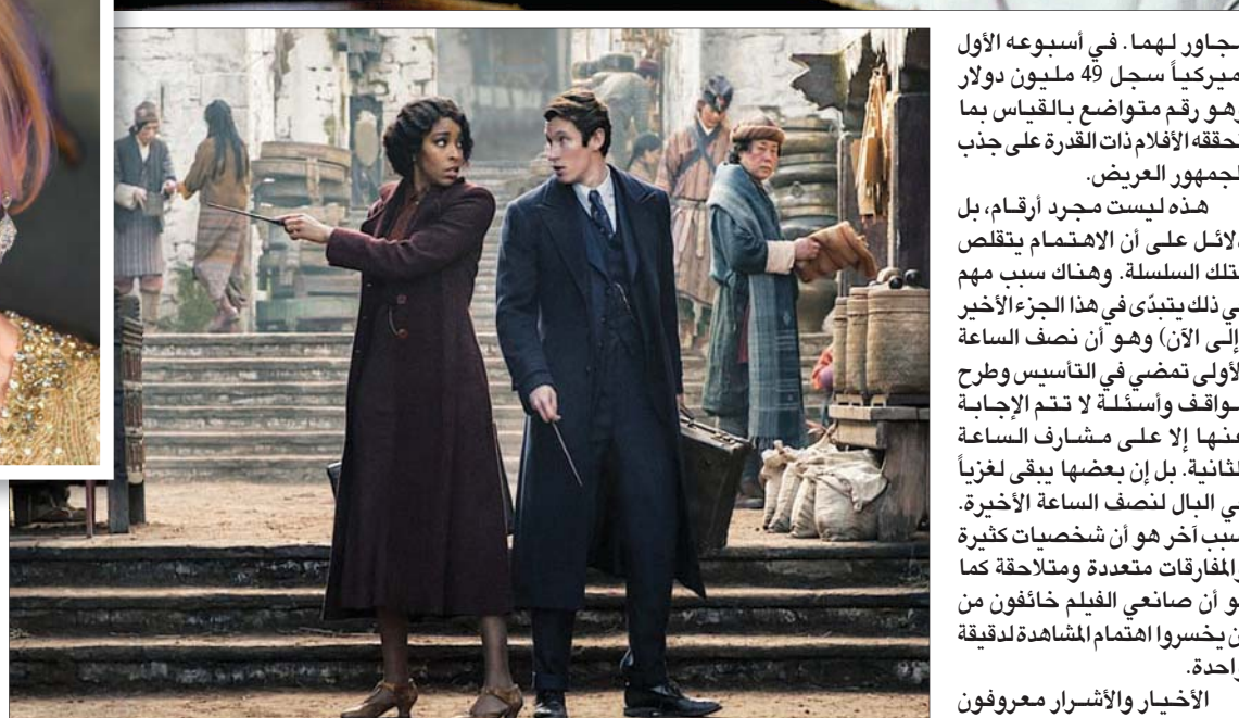
«فانتاستيك بيستس: أسرار ديمبلور»

من حيث إن أحداثه كانت جلية واضحة ومعظمها يقع في النهار. سلسلة المخرج بيتر جاكسون كانت ساحرة ضد سلسلة عن السحرة.