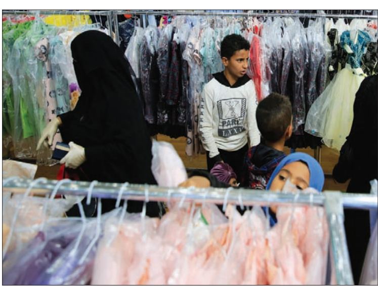
ملابس مجانية مكرسة لأكثر من 15000 طفل من الأسر الفقيرة في اليمن قبل عيد الفطر