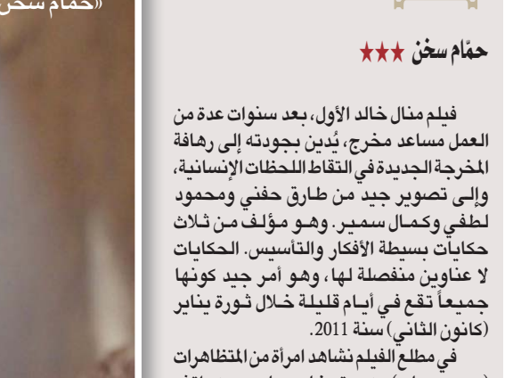
مشهد من «الصوت المنفرد للإنسان»