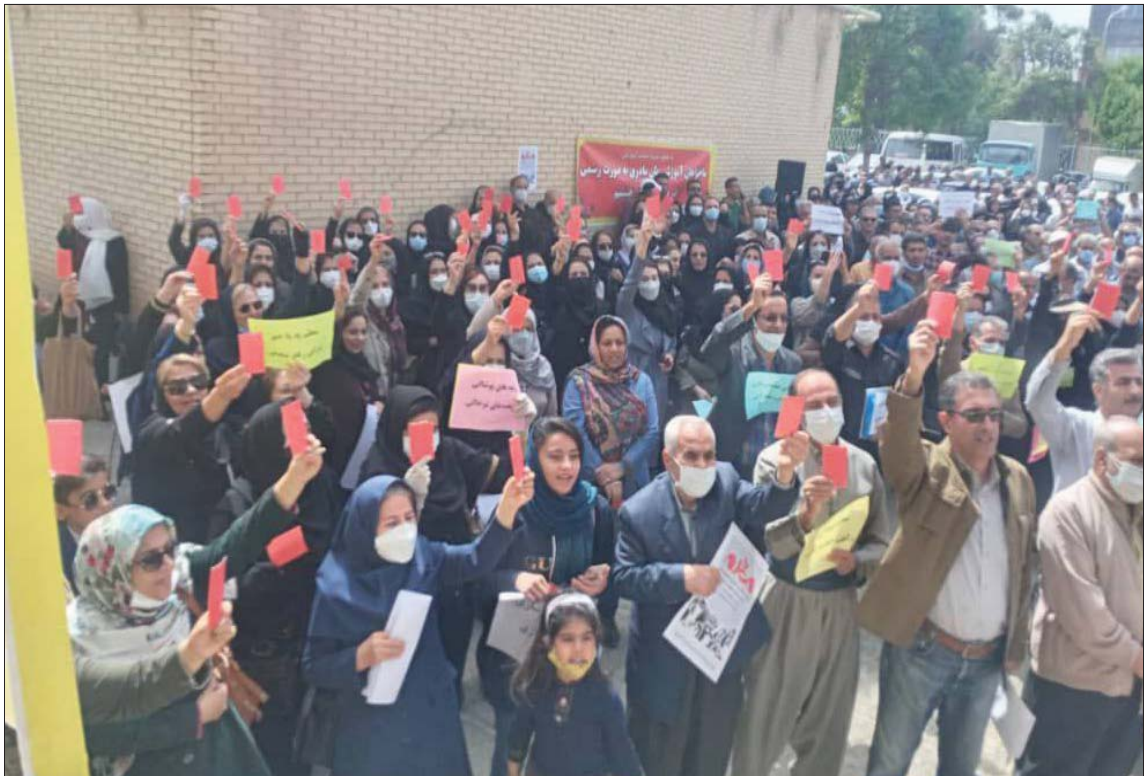
صورة نشرتها «اللجنة التنسيقية لنقابات المعلمين» من الاحتجاجات ضد قرارات وزارة التعليم في سنجند غرب البلاد أمس

وكتبت صحيفة «أفتاب» الإصلاحية: «السيد قاليباف... الاستقالة رجاء». وكتبت على صفحتها الأولى: «سيكتبون في التاريخ: عندما كان الشعب الإيراني يحصل على قوت يومه بشق الأنفس، ذهبت زوجة وابنة رئيس البرلمان إلى تركيا لشراء كسوة الطفل».