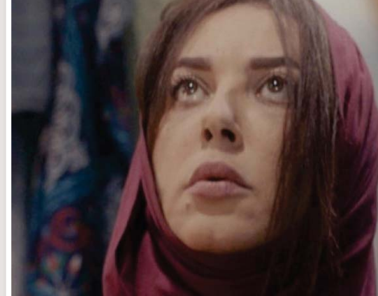
مشهد من «الصوت المنفرد للإنسان»