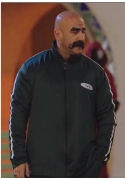
النجم أحمد مكي