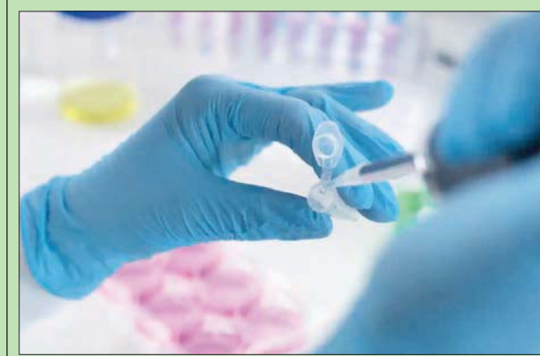
تحليلات جينية معقدة على البول (جامعة إيسيت أنجاليا)

لندن: «الشرق الأوسط» اكتشف العلماء بكتيريا مرتبطة بسرطان البروستاتا اعتبرت ثورة للوقاية من أكثر أشكال المرض فتكا، الأمر الذي جدد الأمل بشأن احتمال الوصول إلى طرق لعلاجها، حسب صحيفة (الغارديان) البريطانية. وأجرى باحثون بقيادة جامعة «إيسيت أنجاليا» تحليلات جينية معقدة على البول وأنسجة البروستاتا لأكثر من 600 رجل مصابين بسرطان البروستاتا وآخرين غير مصابين، ووجدوا خمسة أنواع من البكتيريا مرتبطة بالتطور السريع للمرض. رغم أن الدراسة لا تثبت أن البكتيريا تؤدي إلى سرطان البروستاتا أو إلى تفاقمه، فإنه في حال أكد العمل الجاري الآن دورها في المرض، فسيتمكن للباحثين تطوير اختبارات لتحديد الرجال الأكثر عرضة للخطر وربما العثور على مضادات حيوية لمنع السرطان من قتل الآلاف من الأزواج كل عام. وفي هذا الصدد، قالت الدكتورة هايلي لوكتسون،