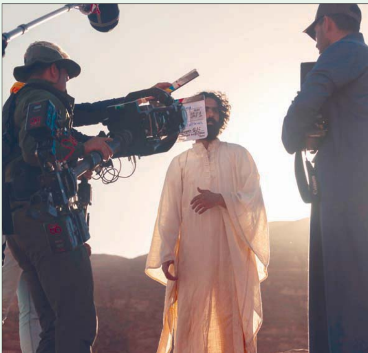
جانب من تصوير فيلم الرمال في نيوم

وأضاف بورغ: «لقد سعدنا بردود الفعل الكبيرة التي صاحبت استقطابنا لإنتاج الأعمال السينمائية العالمية الضخمة في نيوم مثل فيلم (محارب الصحراء)، ونحن متحمسون وفخورون الآن بدعم فيلم (بين الرمال) كإنتاج