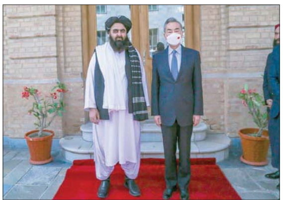
أمير خان متقي مع وانغ يي في كابل أمس

وترى «طالبان» في الصين مصدراً مهماً للاستثمار والدعم الاقتصادي، سواء بشكل مباشر أو عبر باكستان. وعلى عكس الكثير من القوى الغربية، أبتقت الصين سفارتها في كابل مفتوحة ولا يزال سفيرها موجوداً في العاصمة الأفغانية. مع ذلك، أعادت بكين 210 من مواطنيها قديلي سيطرة «طالبان» على العاصمة ولم تعترف أي دولة حتى الآن رسمياً بالنظام الجديد في كابل.