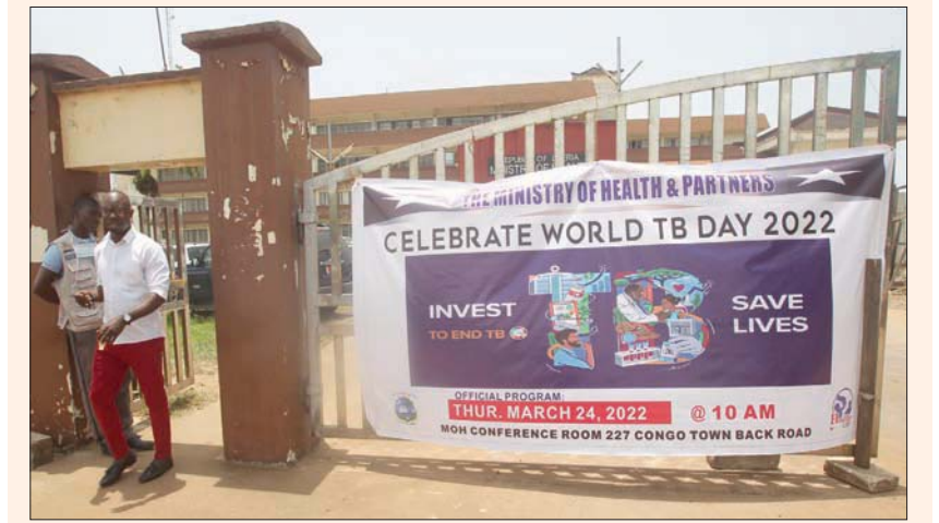
لافتة توعوية بليبيريا في اليوم العالمي للسل

كوبنهاغن، «الشرق الأوسط» السل، كانت حاسمة في ظل تفشي جائحة «كورونا».