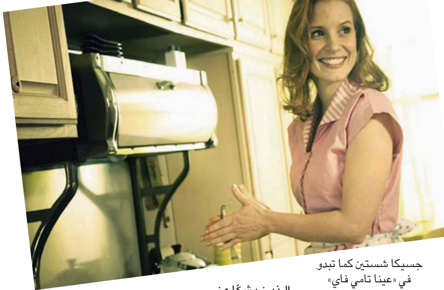
جيسكا شستين كما تبدو في «عينا تامي فاي»

الذين يشكّلون العدد الغالب من المقترعين. بالنسبة لباردام، هناك كثير من مريديه ومنذ سنوات. كميرباتش وغارفيلد يتنافسان فيما بينهما على المركز الثالث. أما دنزل فهو أكثر شجاعة في الأداء، لكن هذا لن يتفعل له.