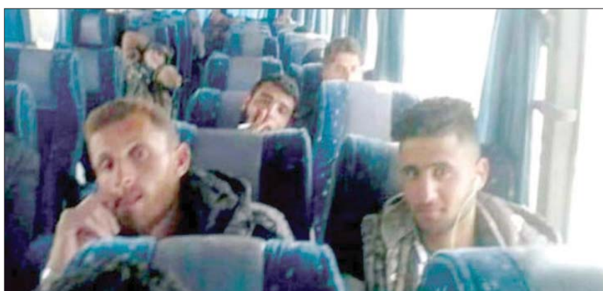
صورة متداولة في مواقع إلكترونية لسوريين جُندوا للقتال في ليبيا مع القوات الروسية