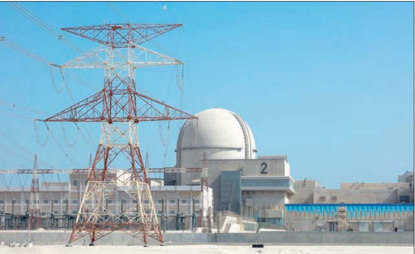
المحطة الثانية في مشروع بركة بدأت في التشغيل التجاري

أعلنت الإمارات، أمس، عن بدء التشغيل التجاري لثاني محطات بركة الطاقة النووية السلمية، وإضافة 1400 ميغاواط من الكهرباء الخالية من الانبعاثات الكربونية لـ«شبكة كهرباء البلاد»، مشيرة إلى أن مجموع ما تنتجه المحطتان الأولى والثانية في بركة يصل إلى 2800 ميغاواط. وأوضحت «مؤسسة الإمارات للطاقة النووية» أن التشغيل التجاري لثاني محطات بركة يؤكد أنها قطعت نصف الطريق نحو الوفاء بالتزاماتها الخاصة بتوفير ما يصل إلى ربع احتياجات الإمارات من الكهرباء، ودعم النمو الاقتصادي على نحو موثوق، من خلال إنتاج الكهرباء الصديقة للبيئة على مدار الساعة طوال أيام الأسبوع، والمساهمة بشكل كبير في تحقيق أهداف مبادرة الدولة الاستراتيجية للحياة المناخي (2050).