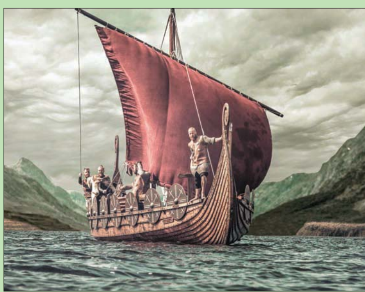
مجموعة من الفايكينغ تبحر من جنوب غرينلاند

أعلى في الارتفاع». ويقول برادلي: «أرندا دراسة كيفية تنوع المناخ بالقرب من المزارع الإسكندنافية نفسها، وعندما فعلنا ذلك، كانت النتائج مفاجئة». سافر برادلي وزملاؤه إلى بحيرة تسمى بحيرة 578. وهي مجاورة لإحدى أكبر مجموعات المزارع في المستوطنة الشرقية. وهناك أمضوا ثلاث سنوات في جمع عينات الرواسب من البحيرة، وجمعوا الفي عينية. ومن خلال تحليل اثنين من العلامات المفاجئة، وتم اكتشاف مفاجأة تأثير الجفاف، والعلامة الأولى، هي هياكل دهنية تعرف باسم (BrGDGT)، والتي يمكن استخدامها لإعادة ربط الهياكل المتغيرة للدهون مباشرة بدرجة الحرارة المتغيرة، أما العلامة الثانية، فهي مشتقة من الطلاء الشمعي على أوراق النبات، لتحديد معدلات فقدان الأعشاب والنباتات الأخرى المدعمة للماشية بسبب الجفخ، فهو مؤشر على مدى الجفاف».