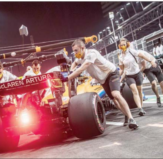
الفنيون خلال تجهيزهم سيارات السباق في الجولة الماضية

كما ستبدأ حصة التجارب الأولى لـ«فورمولا 1» عند الخامسة مساءً على أن تنطلق الحصة التأهيلية لسباقات «فورمولا 2» عند الساعة 06:25، وعند الثامنة مساءً تنطلق حصة التجارب الثانية لـ«فورمولا 1» ثم التجارب الثانية لتحدي «بورشه سبرينت الشرق الأوسط»، كما يشهد غداً (السبت)، جودلاً زمنياً مشابهاً لليوم الذي يسبقه، فيما تبدأ الجولة التأهيلية عند