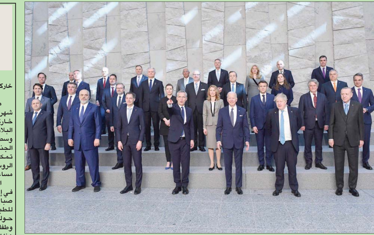
قادة «حلف شمال الأطلسي» خلال قمتهم الاستثنائية في بروكسل أمس

الأوضاع في مناطق القتال وضعت مدينة خاركيف مشابة للعاصمة كييف وباقي المدن الرئيسية، التي وصلت القوات الروسية إلى مقربة منها في بداية حملتها لكنها لم تتمكن من كسر دفاعاتها أو دخولها أو تمكنت من إجبار القوات الروسية على التراجع وكسر مساعيها لتطويق المدينة. (تفاصيل ص 4)