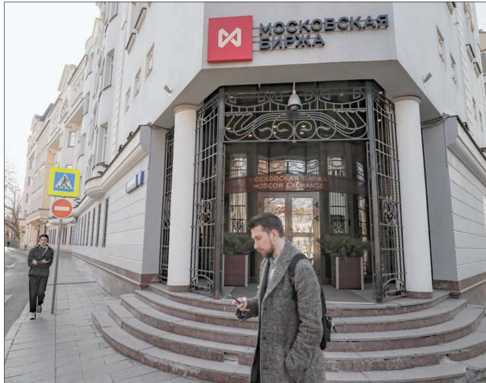
واجهة مبنى بورصة موسكو

الضغوط الاقتصادية على روسيا وإنهم ينظرون فيما إذا كان بوسعهم فعل المزيد لمنع الرئيس فلاديمير بوتين من استخدام احتياطات روسيا من الذهب.