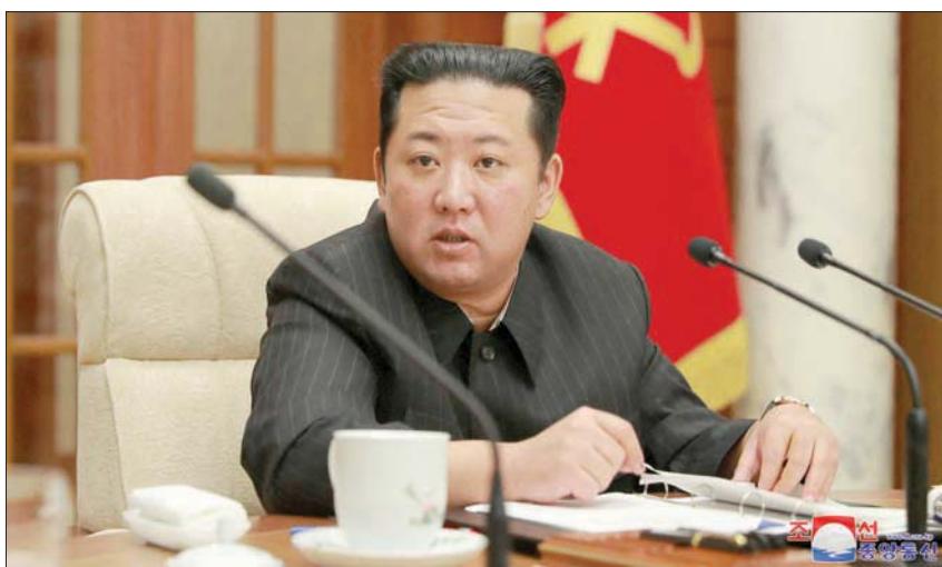
زعيم كوريا الشمالية كيم جونج خلال احتفالية في بيونغ يانغ 19 يناير

وقال الباحث في معهد آسان لدراسات السياسات غو ميونغ - هيون في تصريح لوكالة الصحافة الفرنسية إن «بيونغ يانغ حاولت إطلاق صاروخ باليستي عابر للقارات (الأسبوع الماضي) لكنها فشلت في ذلك... لذا قامت بإطلاق الصواريخ ومشتات القيادة والدعم وغيرها من الأهداف في كوريا الشمالية إذا لم الأمر. واعتبر رئيس الوزراء الياباني فوميو كيشيدا أن التجربة الأخيرة «عمل من أعمال العنف غير المقبولة».