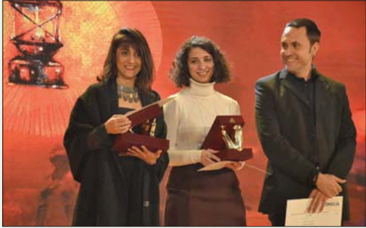
توزيع الجوائز على الفائزين في المهرجان