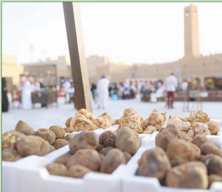
الزبيدي والخلاسي أشهر أنواع الفقع في السعودية.

الهدروجينية لهذه البقايا، ما يساعده على النمو. واستضاف المهرجان، الذي انطلق الأربعاء ويستمر حتى السبت المقبل، عدداً من الباعة المحليين ليعرضوا محصولهم من الفقع، بالإضافة إلى منطقة للطعام تتضمن عروض الطهي السريعة، بالإضافة إلى هم الزوار المحليين والسياح. وتوفر الفعالية تجارب عائلية وترفيهية في مناطق مخصصة، وفرص عمل جديدة للعاملين في القطاع، وجلسات تذوق للمهتمين، ومنصة أكبر للمنتجين، والمطاعم، والطهاة المحليين.