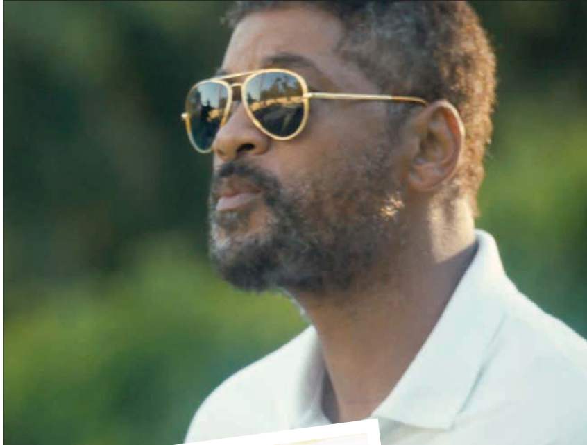
ول سميت أكثر احتمالاً

1 - جين كامبيون: «قوة الكلب» 2 - شيان هدر: «كودا» 3 - ريو سوكي هاماغوتشي: «قد سيارتي» لوق».