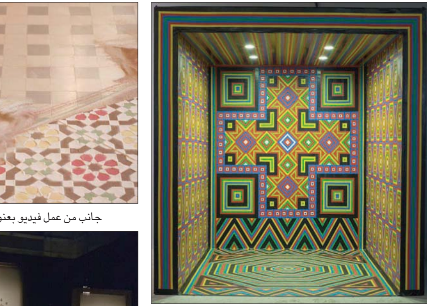
عمل عُرض في معرض بجدة

وربما قد ذلك يفسر سبب لجونها لحرفيين ماهرين في بعض الحرف التي لا تتقنها مثل النسيج وهو ما فعلته لتنفيذ عمل لها بعنوان «استمع لكلماتي» الذي نفذته بالتعاون مع حرفي نسيج هندي: «لقد عملت معه لإنتاج منسوجات مطرزة، وهي تقنية تراثية معروفة، أضفت لها الجانب الحديث بإضافة المؤثرات الصوتية، إنه عمل قديم وحديث في ذات الوقت».