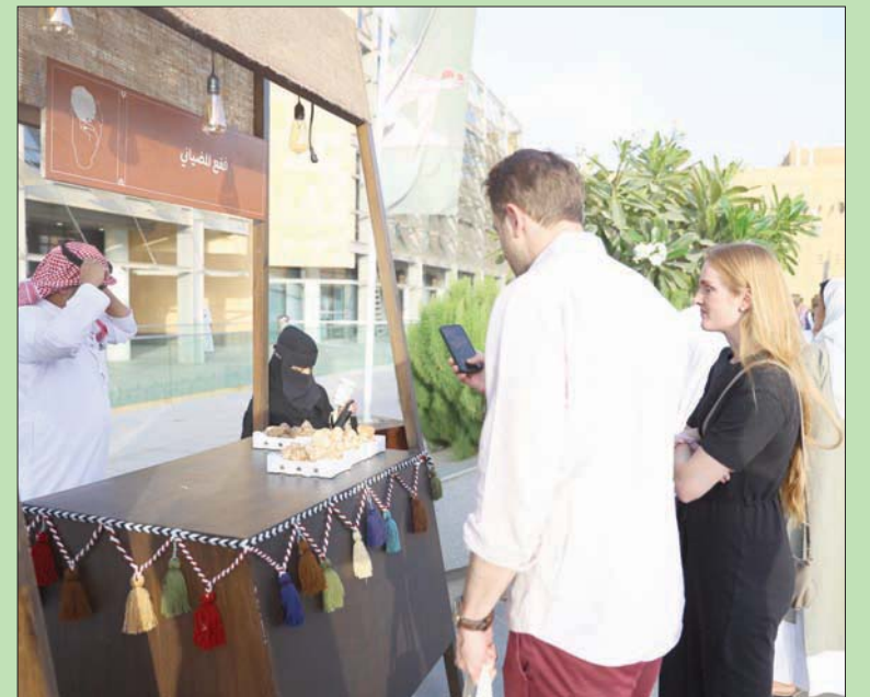
يهدف «مهرجان الفقع» لدعم الباعة المحليين

وتتميز بفوائدها الصحية العديدة، كما تختلف سمياتها بين البلدان، إذ تعد مفردة «الفقع» هي الدارجة بين سكان دول الخليج، ويطلق عليها مواطنو دول المغرب العربي «الترفاس»، لكن في السودان لا تعرف إلا بـ«علاج» أو «ابن الرعد»، إلا أن الاسم المشترك الذي اتفق عليه الجميع هو «الكما». ويوجد الفقع بالعادة في المناطق الصحراوية على عمق يتراوح بين 5 و15 سم في منطقة الحجر الأبيض المتوسط والشرق الأوسط وشمال أفريقيا، حيث ينمو بكثرة في السعودية