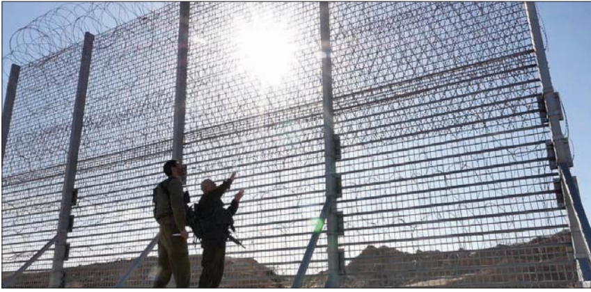
الجدار الأمني العازل حول غزة عام 2021 بارتفاع 6 أمتار