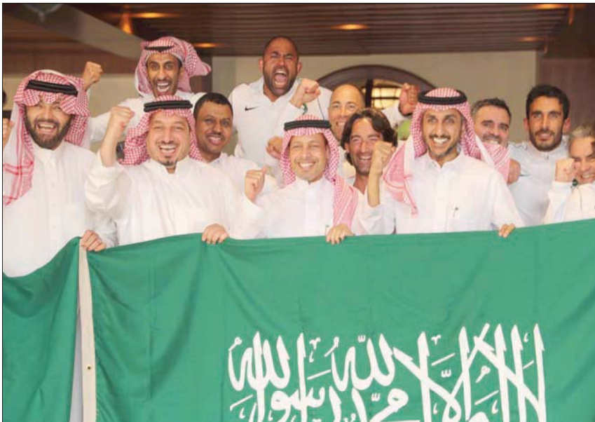
ياسر المسجل وأعضاء اتحاد الكرة يحتفلون أمس بالتأهل السادس لكأس العالم

ووجه المسجل التهنية للجماهير السعودية على هذا الإنجاز الكبير، موجهاً الشكر كذلك للإعلام الذي قدم صورة مثالية للدعم والمؤازرة لمنتخبنا الوطني طوال مشواره بالتصفيات