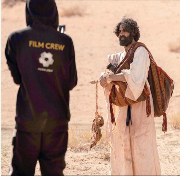
يتناول الفيلم أحداثاً حقيقية تحمل روح الحكاية السعودية (الشرق الأوسط)

نيوم، «الشرق الأوسط» انطلقت في نيوم أعمال تصوير الفيلم السينمائي «بين الرمال»، وهو أول فيلم سينمائي سعودي يحظى بدعم لوجيستي كامل من قطاع الإنتاج الإعلامي في نيوم، وتم اختيار وتمويل الفيلم من هيئة الأفلام السعودية بعد فوزه في مسابقة «ضوء لدعم الأفلام» التي تنظمها الهيئة. ويجري حالياً تصوير فيلم «بين الرمال» في منطقة «بجدة» في نيوم، ومن المقرر إطلاقه في نوفمبر (تشرين الثاني) 2022م. ويتناول الفيلم في فضائه السردي أحداثاً حقيقية ويقدم مفهوم الأبوة باعتبارها ليست مجرد علاقة مع شخص آخر، ولكن رحلة لاكتشاف الذات والنضج وكنموذج يحتذى به للجميع. ومن المقرر أن يعرض الفيلم في مهرجانات سينمائية مرموقة حول العالم، وكذلك سوف يكون متاحاً في أسواق الأفلام ودور السينما والمنصات الرقمية العالمية.