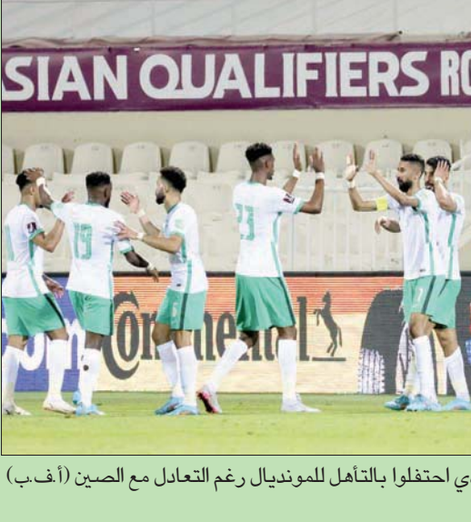
لاعبو المنتخب السعودي احتفلوا بالتأهل للمونديال رغم التعادل مع الصين (أ.ب.ب)

سيول - لندن، «الشرق الأوسط» عادت كوريا الشمالية للتجارب الباليستية الكبيرة، وأجرت أمس تجربة إطلاق صاروخ عابر للقارات، عدت الأبرز لها منذ عام 2017، في خطوة لقيت إشارات دولية واسعة. (تفاصيل ص 11)