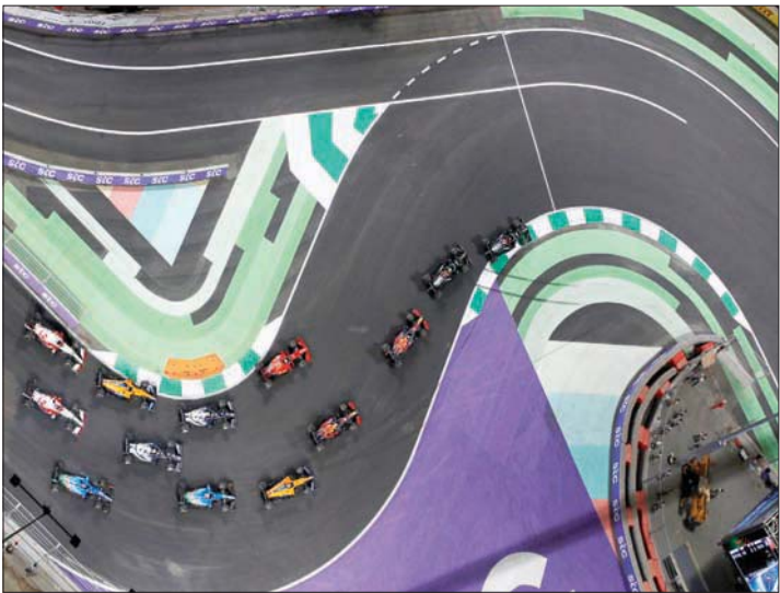
حلبة جدة تترقب نجوم العالم في جولة «فورمولا 1» الثانية

وتشارك السائق الاحتياطي الألماني نيكو هولكنبرغ مع «استون مارتن» في حلبة الصخري بدلاً لمواظبه فيتل واحتل المركز 17 في السباق، وأكد الفريق أن هولكنبرغ سيكون في جدة للقيادة بدلاً لفيتل مرة أخرى إذا دعت الحاجة لذلك.