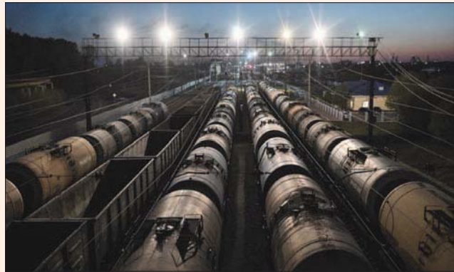
نات «أوبك بلس» بنفسها عن الملف الأوكراني في اجتماعات تحديد السياسات

ويحلل الساعة 1304 بتوقيت غرينتش، انخفضت العقود الآجلة لخام برنت 97 سنتاً أو 0,80 في المائة إلى 120,63 دولار للبرميل، وتراجعت العقود الآجلة لخام غرب تكساس الوسيط 1,08 دولار أو 0,94 في المائة إلى 113,85 دولار للبرميل. وصعدت عقود الخامين دولارين ودولاراً على الترتيب في المعاملات المبكرة.