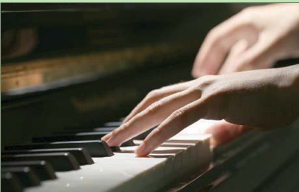
الموسيقى تحسن الرفاهية ونوعية الحياة

لندن: «الشرق الأوسط» وأكدت شبكة الجمعية الطبية المفتوحة أن «التدخلات الموسيقية ترتبط بتحسينات ذات مغزى في الرفاهية»، حسب أوالمشاعر الداخلية»، حسب صحيفة (الغارديان) البريطانية. وبإمكان الموسيقى النفاذ للقلب مباشرة، فهي لا تحتاج إلى واسطة. وقد أكد تحليل تجريبي جديد شيئاً ينطبق على العديد من محبي الموسيقى، وهو أن الغناء أو العزف أو الاستماع إلى الموسيقى يمكن أن يحسن الرفاهية ونوعية الحياة. وأظهرت مراجعة لـ 26 دراسة أجريت في بلدان عدة، بما فيها أستراليا والمملكة المتحدة والولايات المتحدة، أن الموسيقى قد تعطي دفعة إكلينيكية كبيرة للصحة النفسية. وشملت 7 من هذه الدراسات المعالجة بالموسيقى، ونظرت 10 دراسات في تأثير الاستماع إلى الموسيقى، كما فحصت 8 منها الغناء، ودرست إحداها تأثير