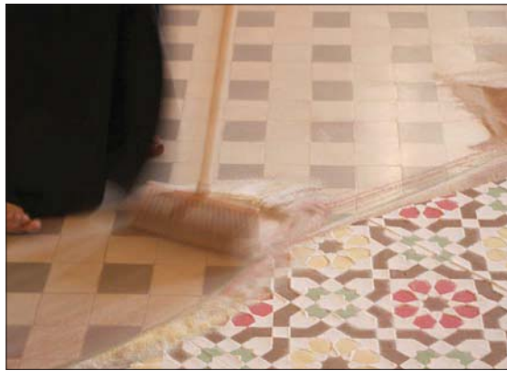
جانب من عمل فيديو بعنوان «ذهبت بعيداً ونسيتك»