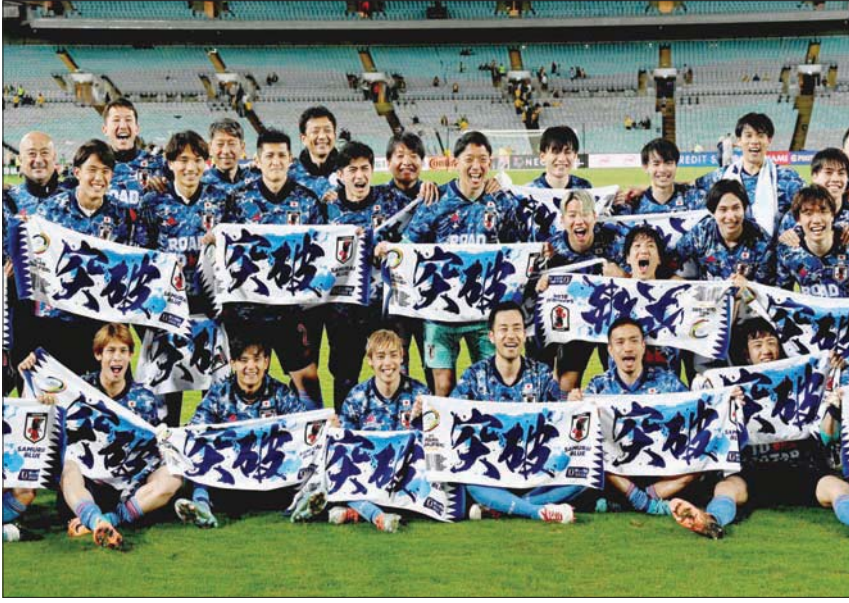
لاعبو اليابان يحتفلون بصعودهم لكأس العالم بعد الفوز على أستراليا

ولم تفلح المحاولات السعودية الأخيرة في الدقائق التي أعقبت هدف التعادل من تعديل النتيجة واستعادة تقدم الأخضر الذي حقق التعادل الثاني له في مشواره بالتصفيات الحالية ومعها توقفت سلسلة انتصاراته مجدداً.