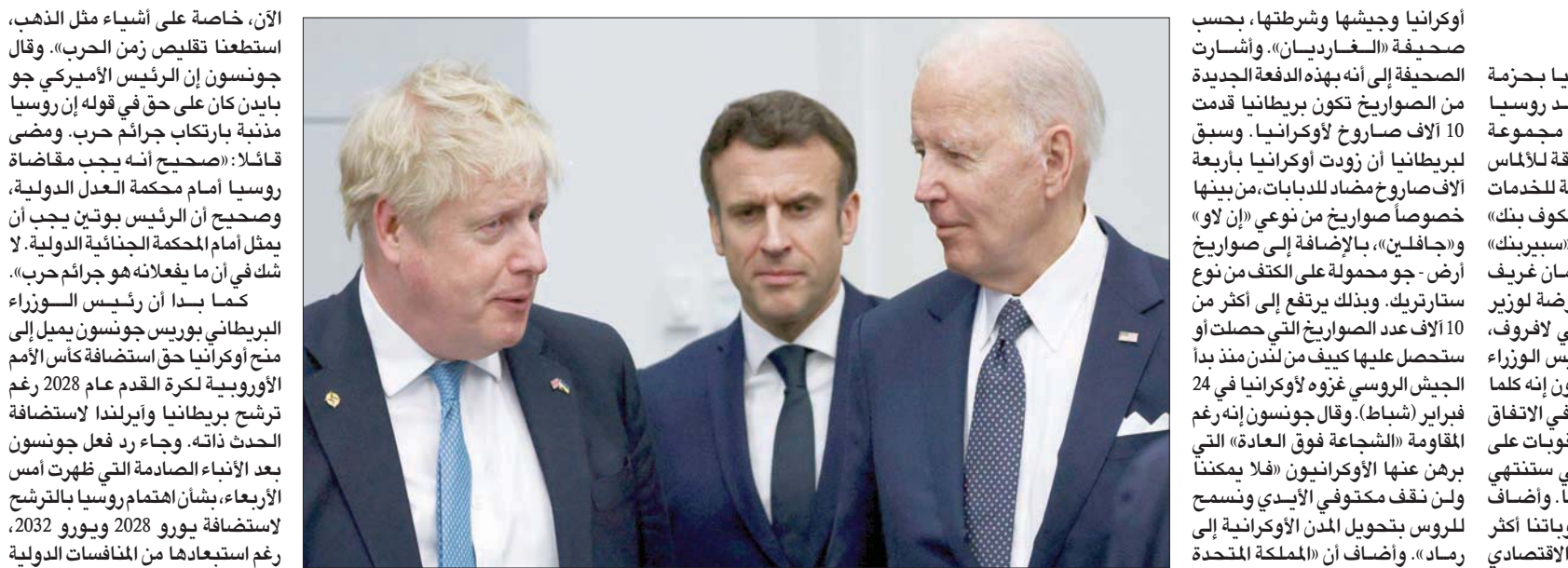
جونسون مع باينز وماكرون

الآن، خاصة على أشياء مثل الذهب، استطعنا تقليص زمن الحرب». وقال جونسون إن الرئيس الأميركي جو بايدن كان على حق في قوله إن روسيا منذنة بارتكاب جرائم حرب. وضمن قائلا: «صحيح أنه يجب مقاضاة روسيا أمام محكمة العدل الدولية، وصحيح أن الرئيس بوتين يجب أن يمثل أمام المحكمة الجنائية الدولية. لا شك في أن ما يفعله هو جرائم حرب».