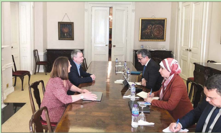
لقاءات وزير السياحة والآثار المصري مع منظمي الرحلات ببريطانيا (وزارة السياحة والآثار المصرية)

كاتبون الثاني) الماضي، بإلزام إحدى الجهات الدولية أو المحلية جميع المنشآت الفندقية والسياحية في مدينة شرم الشيخ كمرحلة