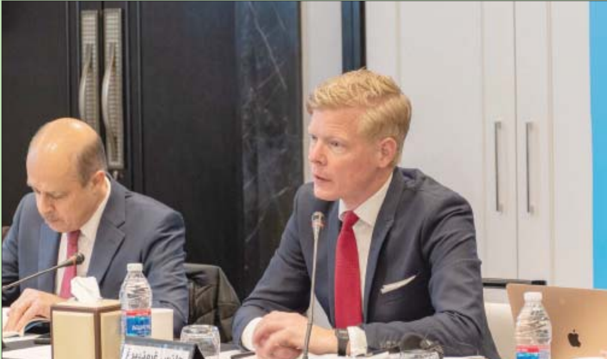
المبعوث الأممي هانس غرونديبيرغ ونائبه معين شريم خلال المشاورات مع الأحزاب اليمنية المختلفة

من جانبه، قال عدنان العديني وهو نائب رئيس الدائرة الإعلامية في التجمع اليمني للإصلاح «تأمل أن تقود هذه المشاورات إلى تقوية المعركة الوطنية بالقدر الذي يعيد الاستقرار لليمن ويحمي أمن المنطقة من التهديد المباشر لجماعة الحوثي ومن خلفها إيران».