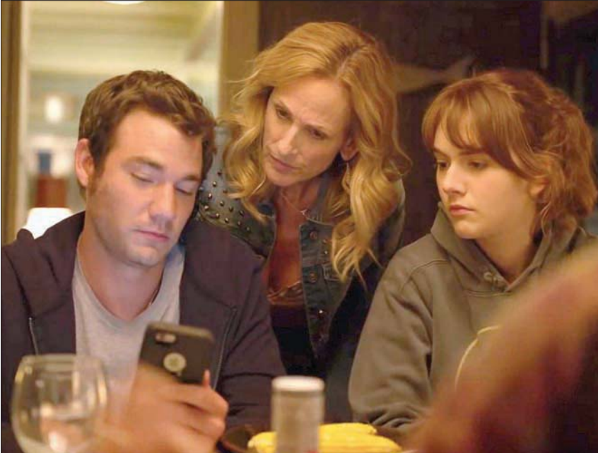
«كودا»... الفرس الأسود في السباق

ديبون الجائزة لما بذلته من أداء درامي وراقص في «وست سايد ستوري». ثانياً هي لانتينية وستكون لفئة مهمة للأكاديمية أن تمنح «الإقليات» مزيداً من الجوائز. دنست أفضل الممثلات وأقلهن حظاً لليوم ودورها في «قوة الكلب» يستحق التقدير وقد يقفز الأوسكار ليديها، وإن حدث فستكون مفاجأة غير متوقعة. تفضيل الناقد: كرسن دنست