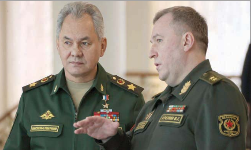
صورة لوزير الدفاع الروسي (يسار) مع نظيره البيلاوروسي تعود للثالث من فبراير الماضي

إجراء المحادثات، بالنظر إلى المخاطر الكبيرة للصراع، وهو ما قد لا يحصل قريبا. وقال آخرون إن بوتين قد يكون ينظر الآن إلى الولايات المتحدة، على أنها خصم حازم عازم على إسقاطه، ولا يستحق عناء الاتصال به أو تبادل المعلومات معه. وأشار الروسي لفرقة وجيزة في وسائل الإعلام الرسمية أمس (الخميس)، ضمن اجتماع كبار المسؤولين. وظهر شويغو (66 عاما) على جزء من شاشة التلفزيون يظهر فيه كبار المسؤولين، بينما ظهر الرئيس فلاديمير بوتين في الجزء الآخر متحدثا إلى مجلس