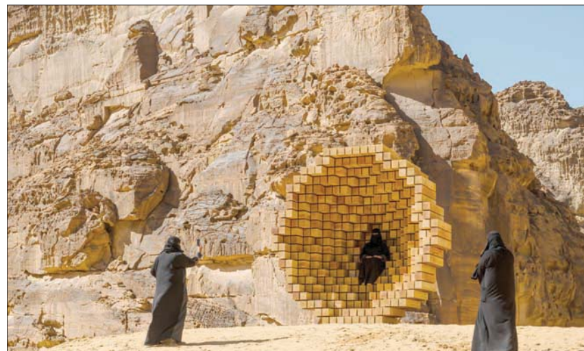
«حيث يرقد الساكنون» في ديزرت إكس العلا

ترى الفنانة أن الفن الإسلامي لجاً لتلك الأشكال الرياضية للتعبير عن رسم الكائنات الحية: «الهدا تتنم