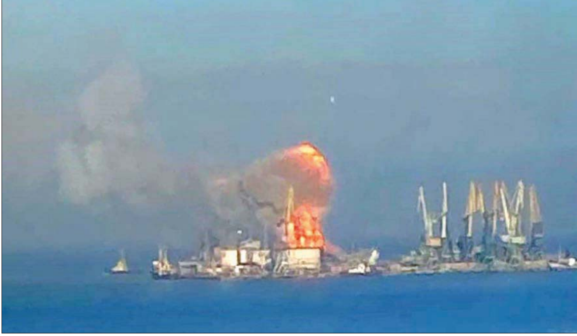
أكدت البحرية الأوكرانية أنها دمرت سفينة روسية لنقل الجنود راسية في ميناء بيرديانسك بالقرب من ماريوبول على بحر آزوف (أفب)

وأكد قائد قوات الدفاع الإشعاعي والكيميائي والبيولوجي في الجيش الروسي، إيغور كيريلوف، في إحاطة صحافية، أن الوثائق التي أصبحت بحوزة وزارة الدفاع الروسية بشأن أنشطة النخاعون البيولوجية العسكرية في أوكرانيا تسلط الضوء على صلات بين مؤسسات في الولايات المتحدة ومواقع بيولوجية عسكرية في أوكرانيا. وقال: «تجدد الإشارة إلى تورط هيكل مقربة من الإدارة الأميركية في الأنشطة المذكورة، بما في ذلك صندوق يقوده هانتر باينز». وأشار المسؤول العسكري الروسي إلى الهجوم الواسع لهذا البرنامج، مؤكداً أن جهات أميركية مختلفة شاركت في تطبيقه علاوة على البنتاغون، بما فيها الوكالة الأميركية للتنمية الدولية وصندوق جورج سوروس ومراكز السيطرة على الأمراض والوقاية منها، بالإضافة إلى الإشراف العلمي من منظمات بحثية رائدة، منها