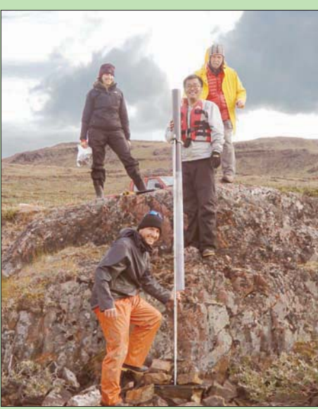
الفريق البحثي أثناء جمع العينات

استاذ علوم الأرض بجامعة ماساتشوستس امهيرست الأميركية، وأحد المؤلفين المشاركين بالدراسة في تقرير نشره أول من أمس: «قبل هذه الدراسة، لم تكن هناك بيانات من الموقع الفعلي لمستوطنات بداية العصر الجليدي الصغير، وهي فترة من الطقس البارد بشكل استثنائي، لا سيما في شمال المحيط الأطلسي، جعلت الحياة الزراعية في غرينلاند غير مقبولة. ويشير ريموند برادلي،