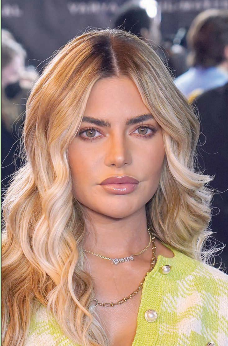
عارضة الأزياء البريطانية ميغان بارتون هانسون لدى حضورها العرض الأول لفيلم «الإسعاف» في لندن (أ.ف.ب)