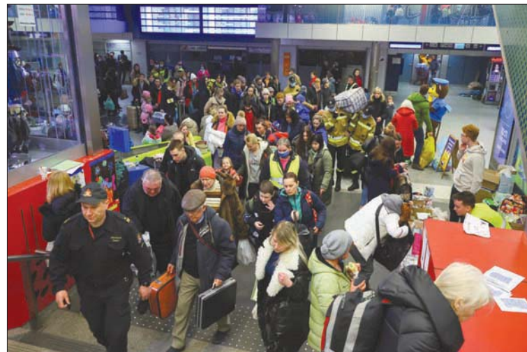
متطوعون يبدلون لاجئين متجهين نحو برلين في محطة قطار كراكوف

المجر خمسة معابر حدودية مع أوكرانيا، وعدة مدن محاذية لها. إلى ذلك، غُتِر 245569 أوكرانياً إلى سلوفاكيا. والسحود مع سلوفاكيا هي الأصغر مسافة بين أوكرانيا وبين كل جاراتها. كما لجأ نحو 184563 شخصاً إلى روسيا، وترى المفوضية أن 50 ألف شخص من منطقتي دونيتسك ولوغانسك المواليين لروسيا في شرق أوكرانيا تمكن 2548 شخصاً من الوصول إلى بيلاروسيا، وفق تعداد المفوضية.