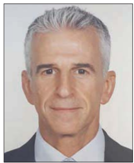
رئيس جهاز الموساد دافيد باريناع

بايران القديمة (فارس) وحاكمها «هامان». وتضمن النشر شريطاً بين بعض الأسرار الشخصية