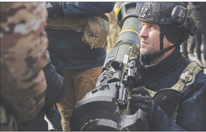
جنود أوكرانيون يتدربون على استخدام صواريخ مضادة للدبابات في كييف

يمكن إطلاق كلا السلاحين مباشرة على أهداف مثل جنود