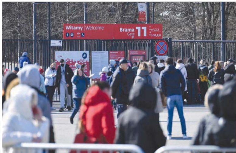
لاجئون أوكرانيون ينتظرون الحصول على أرقام هوية في ملعب بوارسو أمس