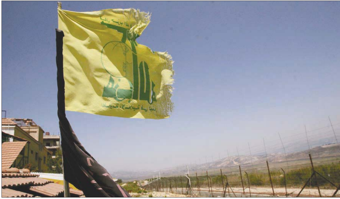
راية «حزب الله» يرفرف في كفرخل بالقرب من سباج على الحدود الإسرائيلية - اللبنانية