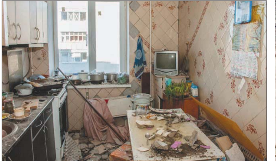
مطبخ تعرض لأضرار بعد القصف في خاركيف أمس