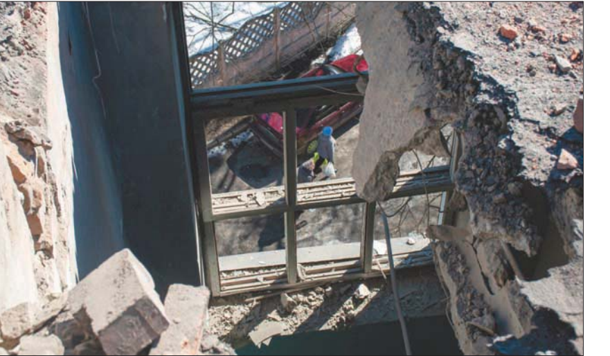
سيده تمشي في أحد شوارع خاركيف المدمرة أمس (أب)

بالمقارنة مع سلاح «Javelin» المضاد للدبابات الأميركي المصنع، والذي أشاد به المسؤولون في البنتاغون والبيت الأبيض وأرسلوه إلى أوكرانيا بالألاف، فإن «NLAW» يزن نحو نصف الوزن، وتكلفته