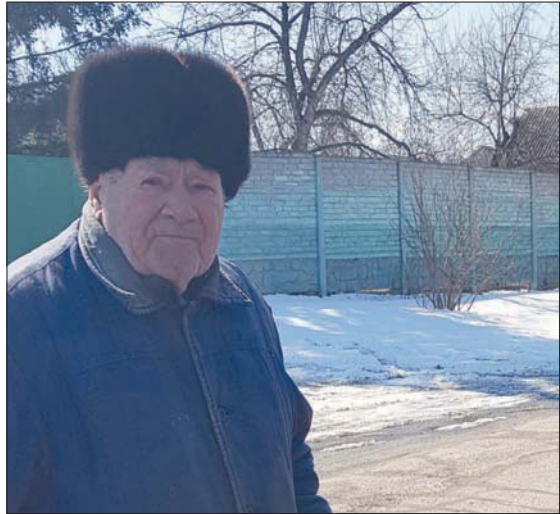
أخر مقاتل من الحرب العالمية الثانية متبق في خاركيف (الشرق الأوسط)

وسط العاصمة لا يزال خالياً كما كل يوم، وحدها فرق صيانة الكهراء على عمل إعادة وصل الأسلاك، وفريق نزع الألغام بشاحنة مصفحة ينقل صاروخاً لم يفجر من بين المكاتب إلى موقع تججير بعيد عن المدينة.