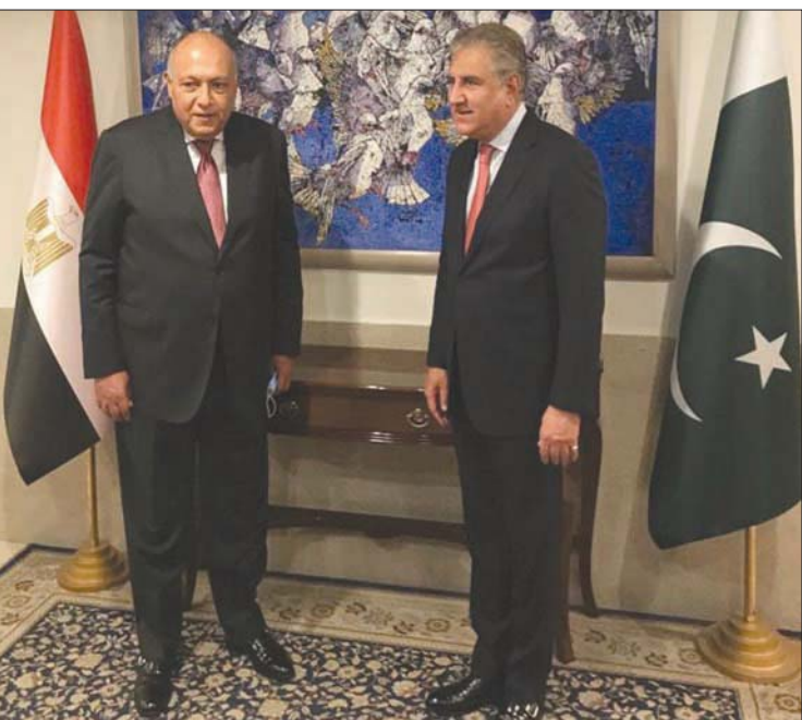
شكري خلال لقائه وزير الخارجية الباكستاني (وزارة الخارجية المصرية)

دمشق، «الشرق الأوسط» كشف وزير التجارة الداخلية في دمشق عمرو سالم أنه سيتم بيع مادة البرغل (القمح المسلووق والمجروش) في صالات المؤسسة العامة للخبازة، عبر البطاقة الذكية وبسعر أقل من نشرة الأسعار في رمضان. وفيما لم يتم بعد دراسة الكميات التي سيتم تخصيصها للعائلة الواحدة، إلا أن البرغل يضاف إلى قائمة المواد الأساسية