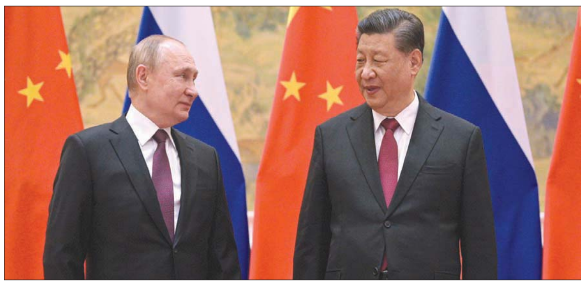
شي لدى استقباله بوتين في بكين 4 فبراير 2022

سؤال عما إذا كان شي جينبينغ قد طلب من فلاديمير بوتين إنهاء غزوه لأوكرانيا، قال شي غانغ: «في اليوم الثاني من العملية العسكرية الروسية، تحدث الرئيس شي جينبينغ مطولاً مع الرئيس فلاديمير بوتين، وطلب من الرئيس بوتين التفكير في استئناف محادثات السلام». في شأن متصل، حث رئيس الوزراء البريطاني بوريس جونسون الصين أمس على اتخاذ موقف حيال النزاع في أوكرانيا وإدانة الغزو الروسي لهذه الأخيرة. وخلال مقابلة مع صحيفة «صنداي تايمز»، دعا جونسون الصين حليفة موسكو الاستراتيجية، ودولاً أخرى لم تتخذ موقفاً بعد، إلى الانضمام إلى الدول الغربية في إدانتها للغزو الروسي لأوكرانيا. وقال جونسون: «مع مرور الوقت ومع تزايد الغطاء الروسي، اعتقد أن من الأصعب والمخرج سياسياً للتغاضي عن غزو بوتين». وأضاف أن هناك «معضلات كبيرة» للدول التي لم تتحدث بعد