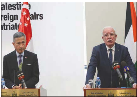
وزير الخارجية الفلسطيني ونظيره السنغافوري أمس في رام الله (وفا)

الإدارة الأمريكية الحالية بشأن القضية الفلسطينية: «إيجابية، ويمكن البناء عليها»، مستدر كاً بأنه «لا يمكن الرهان عليها، ما لم يتم اتخاذ خطوات عملية ولموسسة لفتح أفق لعملية السلام». وكان المسؤول الفلسطيني يعقب على تصريحات حول للخارجية الأميركية، حول ضرورة أن تكون هناك دولة فلسطينية ديمقراطية وقابلة للحياة، باعتبار أن حل الدولتين المتفاوض عليه هو أفضل طريقة لحل النزاع الفلسطيني الإسرائيلي. ولاققت التصريحات، إلى جانب تصريحات أدلى بها السفير الأميركي في إسرائيل، توماس نايدز التي أكد فيها حق الشعب الفلسطيني في حكم مستقبله بنفسه، ورفضه التوصل لزيارة المستوطنات الإسرائيلية في الأرض الفلسطينية المحتلة، ترحيباً في رام الله التي رأت في هذه التصريحات «بادرة جيدة؛ لكنها غير عملية». وقالت الخارجية الفلسطينية، أمس، إن هذه التصريحات والمواقف «غير كافية»، وإن تكرارها دون ممارسة عملية هو تفرغ لضمونها الحقيقي. ومع الوقت، وبسبب هذا التكرار، تفقد بريقها لتصبح مجرد حمل لتخلص من أي إخراجات ضاغقة أو سياسية؛ خصوصاً حان الوقت لتطبيق وعودها والوفاء بالتراماتها، وترجمة كل ما تقوله بخصوص القضية الفلسطينية إلى خطوات عملية؛ وهل هناك خريطة طريق