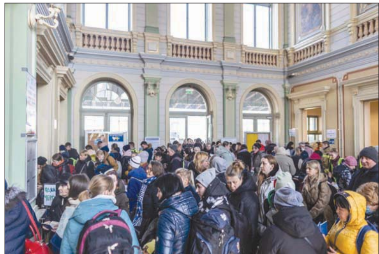
لاجئون ينتظرون الحصول على تذكر مجانية في محطة قطارات بشيمشل