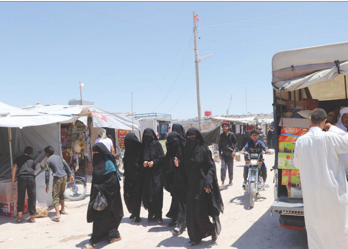
صورة أرشيفية للاجئين عراقيين في مخيم الهول شمال شرقي سوريا

فيقدر بنحو 4 آلاف. وناقش هذا الملف وفد امريكي بارز، زار المنطقة قبل أيام مع قادة (قسد) والإدارة الذاتية».