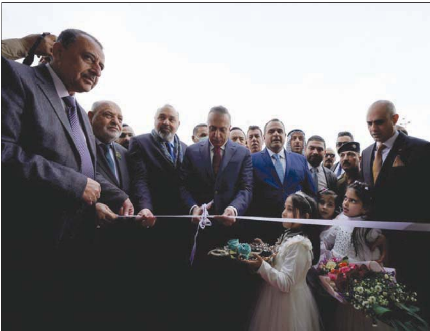
رئيس الوزراء العراقي مصطفى الكاظمي يفتتح مستشفى جديدا في الموصل أمس

وجه رئيس الوزراء العراقي المنتهية ولايته مصطفى الكاظمي، من محافظة نينوى التي زارها أمس، مجموعة رسائل سياسية دعا فيها الأحزاب والقوى السياسية إلى العمل من جهة أخرى إمكانية التوصل إلى حسم القضايا العالقة بدءاً من انتخاب الرئاسات. ووفقاً لذلك، فإن «الإطار التنسيقي» يقف إلى جنب «الاتحاد الوطني الكردستاني» ويدعم مرشحه برهم صالح رغم خلافات العديد من قيادات «الإطار» مع صالح بسبب عدم التحاق «الاتحاد الوطني» مع «الإطار التنسيقي» في تحالف على غرار التحالف الثلاثي، لأنه لا يريد المضي في تمزيق البيت الشيعي. وطبقاً لمصالحات الشيعية نفسها؛ فإن إصرار «الإطار» على تسمية «الكتلة الكبرى» قبل الدخول في جلسة انتخاب رئيس الجمهورية يلقى قبولا من «الاتحاد الوطني الكردستاني» بينما يعارضه «تحالف السيادة» والحزب الديمقراطي الكردستاني». ووفقاً لذلك، لا توجد أي مؤشرات حتى الآن على إمكانية ذهاب قسم من «الإطار» مع تحالف الصدر خصوصاً بعد اتصال الصدر بالكاظمي. فبقيا رأى كل من تحالفي «السيادة» والحزب الديمقراطي» أن هذا الاتصال قد يكون ضمن لتحالفهم مع الصدر أغلبية الثلثين المطلوبة لتحرير مرشحهم، فإنه جاء بنتائج عكسية حيث أصر «الإطاريون» على حسم «الكتلة الكبرى» داخل البيت الشيعي.