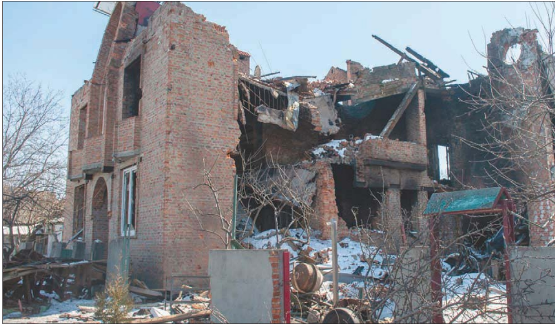
مبنى تعرض للقصف في خاركيف أمس

حول مدينتهم وضواحيها. لا يبعد خط الاشتباك الروسي - الأوكراني عن قلب خاركيف أكثر من ربع ساعة في السيارة. كلما اقتربت، ارتفعت أصوات القصف وراجمات الصواريخ. ولكن الحصنة اليومية للسكان من القصف عادة ما تكون ليلاً. وسط هذا الجو الخطر، يمكن أن تجد بعض من تبقى من سكان الأحياء يجتمعون نهراً ويتبادلون المعلومات حول آخر التطورات العسكرية. وإن أجدت الغتتين الأوكرانية أو الروسية، يمكنك أن تتابع أيضاً التحليلات العسكرية التي يستقى أغلبها من التلفزيونات.