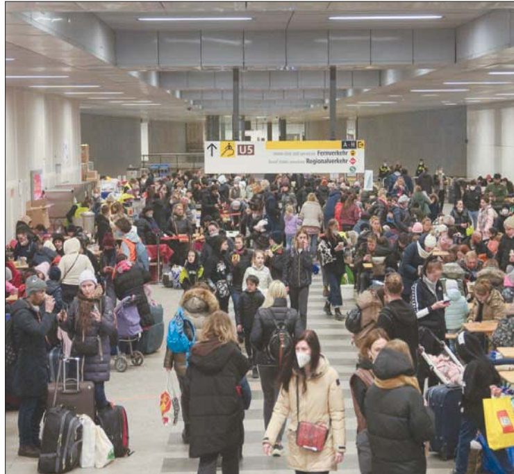
لاجئون أوكرانيون اتخذوا نفقاً أرضياً داخل محطة القطارات الرئيسية ببرلين ملجأ لهم أمس