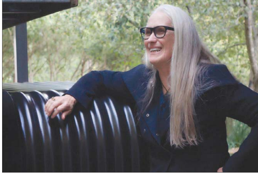
المخرجة جين كامبيون

هذا أيضاً ما سيحدث للأفلام، مثل «بلفاست» و«قوة الكلب» و«الملك رتشارد» و«وست سايد ستوري»، من بين أخرى، كونها وردت هنا ووردت في ترشيحات الأوسكار.