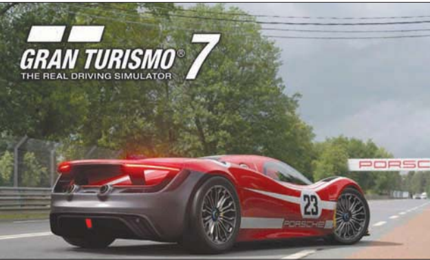
تقدم اللعبة الكثير من السيارات الرياضية

تقدم اللعبة نمط لعب فردي وجماعي. وتطلق الشركة المطورة اسم «خريطة العالم» World Map على نمط اللعب الفردي الذي يتيح للاعبين تجربة جميع السباقات والأطوار الأخرى. ويبدأ اللاعب هذا النمط باستخدام سيارات منخفضة الأداء، ويستطيع من بعد ذلك كسب المال لتطوير سيارته شراء سيارات أفضل للمشاركة في سباقات أكثر تحدياً. وتعرض اللعبة هذه العملية من خلال مركز رئيسي هو «المقهي» يعرض المعلومات المهمة حول كيفية المشاركة في السباقات وتطوير السيارات وشراء الجديد منها، في طريقة سلسلة ومريحة. وكلما كسب اللاعب السباقات وأكمل التحديات، سيحصل على خبرة تزيد من مستواه، مع تقديم ميزة التمرين اليومي للحصول على جوائز يومية مختلفة. وتقدم اللعبة وصفاً دقيقاً للسيارات الموجودة في اللعبة وتاريخها، بصحة رسومات للسيارات تبدو وكأنها حقيقية بشكل يصعب تمييزه. ويستطيع اللاعب الحصول على سيارات جديدة إما بالفوز في السباقات أو شراء تلك السيارات من متجر عالم اللعبة، مع تقديم متجر خاص للسيارات المستخدمة. كما يتوجب على اللاعب الحصول على رخص السباق للمشاركة في سباقات محددة، وهي ميزة لعب معروفة في تاريخ هذه السلسلة. وتقدم اللعبة ميزة «السباق الموسيقي» Music Rally، حيث يجب فيه إكمال السباق السريع قبل انتهاء الموسيقى التي يمكن اختيارها من بين مجموعة ضخمة. ومن شأن هذه الميزة زيادة الحماس في السباقات وجعلها أكثر سرعة ومتعة. أكبر. هذا الأمر يضيف الكثير من