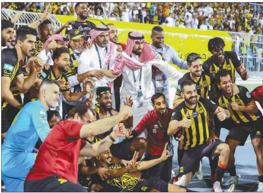
أفراح الاتحاديين مستمرة بعد اقتراب الفريق من الفوز بالدوري