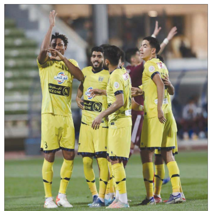
أفراح لاعبي التعاون... هل تتجدد في دوري أبطال آسيا؟

وأكد الخبراء أن الأداء الفني للفريق الثلاثي يعطي مؤشراً سلبياً حول قدرتهم على تجاوز المراكز الحالية في بطولة الدوري، خصوصاً أن العناصر الأجنبية لم تظهر القدرة على مساعدة الفريق في التقدم إلى منطقة الدفء، فيما يتفوق أحياناً عدد من الفرق التي لا تزال في دائرة الحسابات مثل التعاون والطائي وحتى الفيحاء مما يجعلها أكثر قدرة على الثبات في دوري المحترفين الذي دخل المتعلق الأخير فيه حيث تبقت «6» جولات فقط. ويبدو فريق الحزم الأقرب للهبوط لدوري الدرجة الأولى على اعتبار أنه يملك 14 نقطة من 24 مباراة، فيما يحتل الباطن المرتبة الخامسة عشرة برصيد 22 نقطة من 24 مباراة، بينما يملك الاتفاق 24 نقطة من 23 مباراة خاضها محتلاً المرتبة الرابعة عشرة، فيما يوجد الفيحاء في المرتبة الثالثة عشرة برصيد 25 نقطة جمعها من 25 مباراة، فيما يملك ذات الرصيد فريق التعاون الذي يحتل المرتبة الثانية عشرة من خلال 24 مباراة خاضها حتى الآن. ويحتل فريق الطائي الصاعد هذا الموسم المرتبة الحادية عشرة برصيد 26 نقطة من 24 مباراة، فيما يملك الأهلي 28 نقطة من 24 مباراة في المرتبة العاشرة. ويبدو على الورق أن الأندية السعودية المهددة بالهبوط تقارب 9 أندية تملك ما بين 14 نقطة و29 نقطة، لكن الأداء الذي تقدمه أندية الفيحاء والرائد والأهلي والتعاون يقودها نحو بر الأمان وإمكانية