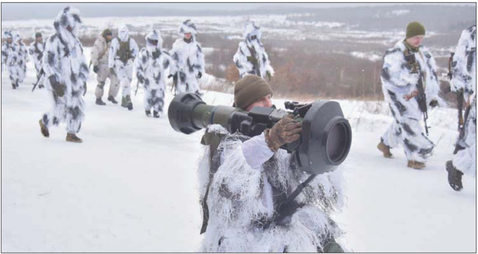
جنود أوكرانيون مع قاذفة صواريخ بريطانية خلال تدريبات في يناير الماضي بقاعدة يافوريف (قرب ليفيف) التي قصفتها روسيا أول من أمس

غير عسكرية. فقد شنّت الحكومة البريطانية أوسع حملة ضد الأترياء الروس (الأوليفغارش) الذين تتهمهم بالارتباط بالرئيس فلاديمير بوتين، وجنّدت ممتلكاتهم وأرصدهم التي تقدر بمليارات الدولارات. كما فرضت عقوبات على طيف واسع من الشركات والمسؤولين الروس الكبار، بمن فيهم 386 عضواً في مجلس «الدوما» ممن صوتوا لمصلحة الاعتراف باستقلال «جمهورتي» لوغانسك ودونيتسك عن أوكرانيا.