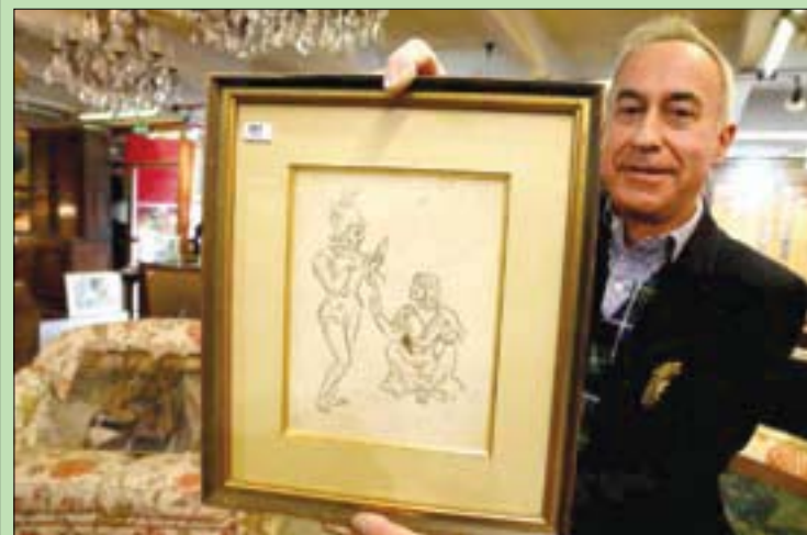
رسم لبول سيزان في مزاد بمدينة رانس الفرنسية (أ.ب.ب)

اكتشاف رائعة. مر هذا الرسم بين يدي ابن سيزان ثم حفيده قبل أن نفقد أثره لما يقرب من ستين عاماً». ورغم أنه تضمن ملاحظة مكتوبة بيد جان بيار سيزان، حفيد الرسام، تشير إلى أن «الرسم الموجود هنا عمل أصلي يحمل