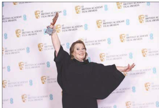
جوانا سكانلان فازت بجائزة أفضل ممثلة عن فيلم «بعد الحب»