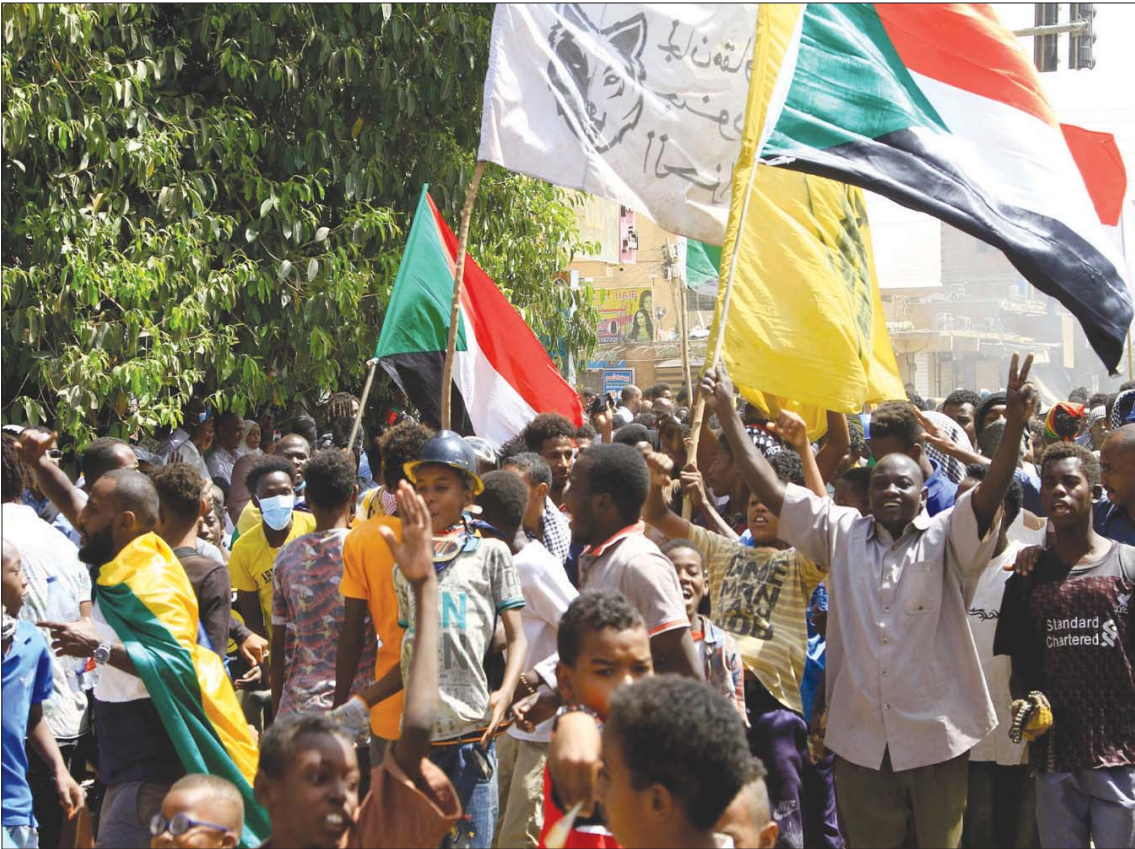
جانب من الاحتجاجات في الخرطوم للمطالبة بالحكم المدني أمس

شهد محيط القصر الجمهوري بالعاصمة السودانية الخرطوم، أمس، اشتباكات عنيفة بين القوات الأمنية وآلاف المتظاهرين الذين نجحوا في اختراق الطوق الأمني المتشد الذي تفرضه السلطات على الطرق والمداخل المؤدية إلى وسط الخرطوم، فيما أقر عضو في مجلس السيادة الانتقالي بتردي الأوضاع الاقتصادية والأمنية والاجتماعية في البلاد.