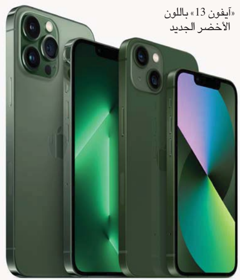
آيفون 13، باللون الأخضر الجديد

* آيفون بلون جديد. أعلنت شركة «أبل» أن «آيفون 13» و«آيفون 13 برو» سيأتيان الآن بلون أخضر جديد، حيث يتوفر كل من «آيفون 13» و«آيفون 13» ميني بلون أعمق مطحلب يحمل ببساطة اللون الأخضر، بينما سيتوفر كل من «آيفون 13 برو» و«آيفون برو ماكس» بظل أفتح يطلق عليه «البيث غرين»، حيث أشارت إلى أن الألوان الجديدة ستتوفر في 18 مارس (آذار). وقال بوب يورشرن، نائب رئيس شركة أبل للمسئور تسويق المنتجات حول العالم: «تغطي هذه الألوان الجديدة المستخدمين خيارات أكثر في جهاز الآيفون ونحن نتطلع لاستفادة المستخدمين مما تقدمه عائلة الآيفون 13، ومنها أداء لا مثيل له مع شريحة