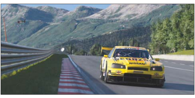
مستويات رسومات واقعية في ظروف جوية متغيرة

«مقود» للقيادة وتحريكها في الهواء بشكل يحاكي تحريك مقود السيارة، لتستشعر الأداة ميلانها بدقة وتعكس أر ذلك مباشرة في عالم اللعبة. وبالنسبة للرسومات، يتعرض اللاعب للرسومات على جهاز «بلايستيشن 5» بشكل مبهج جداً، وتقدم خيار عرض الرسومات بسرعة 60 صورة في الثانية وبالذقة الفائقة 4K، أو خيار الترخيز على عرض الانعكاسات من على الأسطح، أو ميزة تتبع الأضمة الضوئية من مصدرها Ray tracing المتقدمة الموجودة في عده أماكن في اللعبة، من بينها نمط التصوير Photo Mode. وبالحدثين عن نمط التصوير، فيمكن تصوير السيارات في ظروف مختلفة في أكثر من 2,500 موقع تقدم مناظر طبيعية مبهرة.