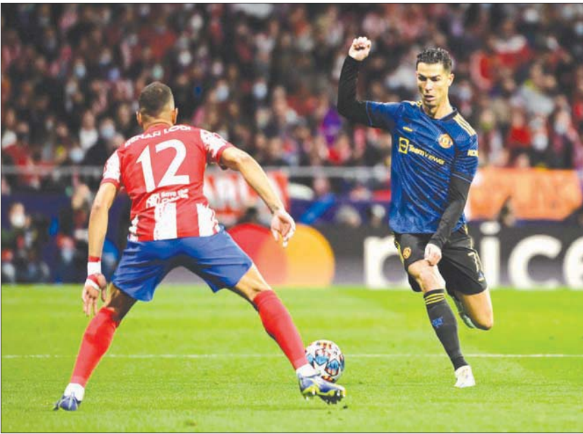
رونالدو نجم يونانيد في مواجهة رينان لودي مدافع أتلتيكو ذهاباً

الحادي عشر في المسابقة هذا الموسم، كما أنه كان صاحب التعادل لبنفيكا عن طريق الخطأ في مرماه. ويبحث هالتر عن استعادة صدارة ترتيب الهادفين من البولندي روبرت ليفاندوفسكي (بايرن ميونيخ الألماني) الذي رفع رصيده إلى 12 هدفاً. قال إريك تين هاغ مدرب أياكس: «لدي شعور مزدوج (بعد الذهاب)، هي نتيجة جيدة لكننا أهدرنا الفوز. لم نترجم فرصتين أو ثلاثاً سهلة». أما نلسون فيرسيمو مدرب بنفيكا فقال: «أنا راض عن الأداء وليس النتيجة، تأقلمنا مع متطلبات المباراة لكن أردنا تحقيق الفوز. وكل الأمور واردة في الإياب». ويتصدر أياكس، بطل أوروبا أربع مرات بينها ثلاث في السبعينات، الدوري الهولندي بفارق نقطتين عن غريمه سبارك نكس.