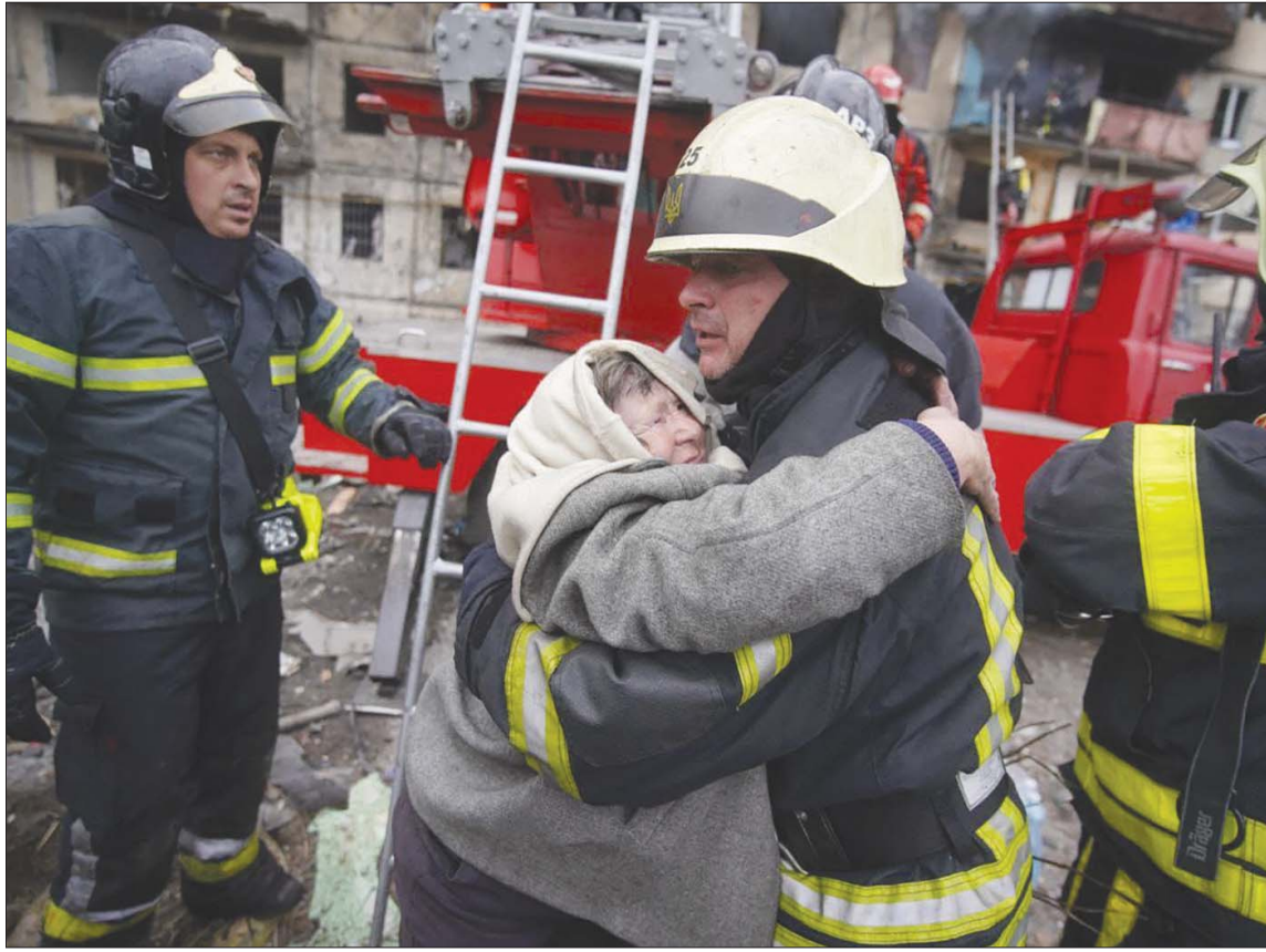
مسنة تحضن رجل إطفاء بعد إنقاذها من عمارة استهدفها القصف في كييف أمس

بزن تبدل ملموس في اللهجة الروسية حول أهداف محاصرة المدن الأوكرانية الكبرى. وبعدها أكدت موسكو أكثر من مرة في السابق عدم تمسكها إلى احتلال المدن، قال الكرملين، أمس، إن الجيش الروسي لا يستبعد فرض «سيطرة كاملة» على المدن الرئيسية، مع مراعاة ضمان «أقصى درجة من الأمن للسكان». تزامن التطور مع انطلاق الجولة الرابعة للمفاوضات أمس، بين الوفد الروسي والأوكراني، ووصف الأخير المناقشات الأوكرانية «شاقة»، فيما قال الرئيس الأوكراني فولودومير زيلينسكي إنه وضع مهمة محددة أمام المفاوضات، تتمثل في ترتيب لقاء مباشر على المستوى الرئيسي. وبعد أكثر من أسبوع على مراوغة القوات الروسية في أماكن تركزها في محيط العاصمة كييف والمدن الكبرى الأخرى، مثل خاريف وماريوبول، بدأ أن قرار اقتحامها قد اتخذ ودخل مرحلة الإعداد العملي لذلك. هذا ما عكسه حديث الناطق باسم الكرملين دميتري بيسكوف الذي قال إن «القوات الروسية لا تستعد وضع مدن كبيرة في أوكرانيا التي أصبحت اليوم مطوقة تماماً، تحت سيطرتها الكاملة باستثناء بعض المناطق المستخدمة لعمليات الإجراء الإنسانية»، متعهداً في الوقت ذاته أن تتم مراعاة «ضمان أقصى درجة من الأمن للسكان». ولفت بيسكوف إلى أن الرئيس الروسي فلاديمير بوتين أمر في بداية العملية الخاصة في أوكرانيا بعدم اقتحام المدن، بما فيها العاصمة كييف، بسبب قيام المسلحين بنشر أسلحة هناك، وأوضح