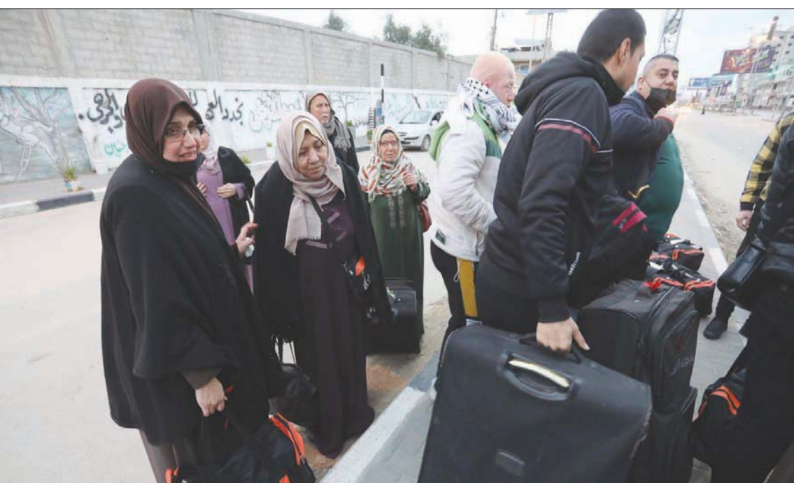
فلسطينيون من مخيم النصيرات بغزة يستعدون للسفر إلى مكة المكرمة أمس عبر رفح لآداء العمرة

سياسة الحصار التي تفرضها إسرائيل ضد غزة ويدعو لإنهائها. ويعد دعم الاتحاد الأوروبي لمشاريع في غزة، فلسطينياً، رغم أن الدعم الكلي للفلسطينيين توقف منذ العام الماضي.