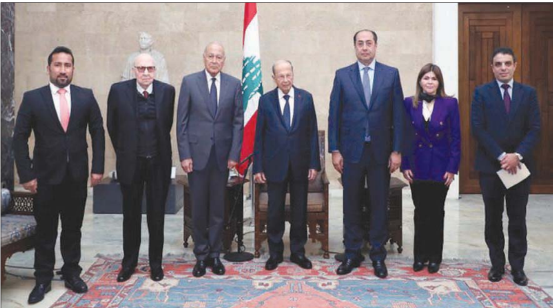
عون لدى استقباله أبو الغيط والوفد المرافق (الرئاسة اللبنانية)

وقال أبو الغيط بعد لقائه عون، إنه وجد تصميمًا على إجراء الانتخابات في موعداً، وإطلاق لبنان نحو المزيد من الاستقرار واستعادة الأوضاع اللبنانية خلال الفترة المقبلة. ولفت إلى أنه استمع إلى «تقويم الرئيس للوضع الدولي وتأثيراته على المنطقة العربية، خصوصاً أن لبنان هو في رئاسة المجلس الوزاري العربي حالياً لمدة 6 أشهر، وابلغته تأكيد الاجتماع الوزاري التشاوري القادم في بيروت منتصف هذه السنة»، مشيراً إلى أنه وجد لدى عون «الكثير من التصميم على المضي ببلدان في