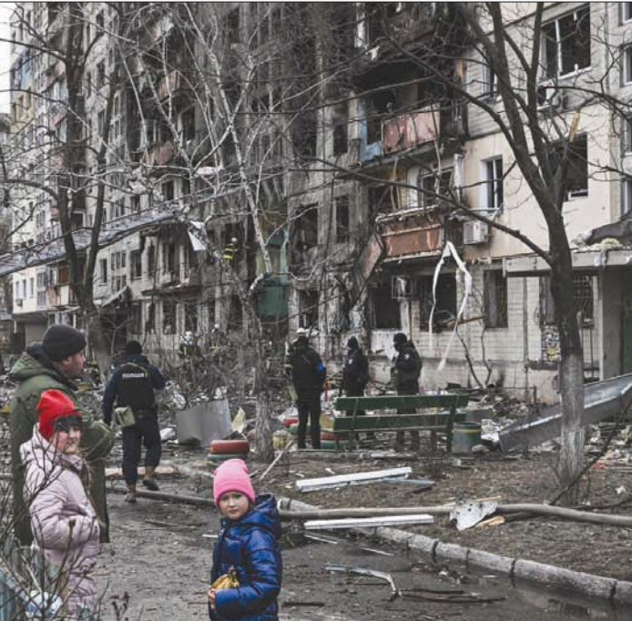
طلفتان أمام بناية مهشمة بفعل القصف على كييف أمس (أ.ف.ب)