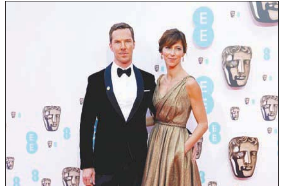
بندكت كمبرباتش بطل «قوة الكلب» وزوجته في حفل باقتا (د.ب.أ.)