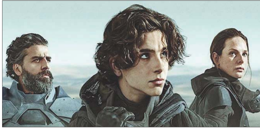
«دون»: فاز بخمس جوائز باقتا