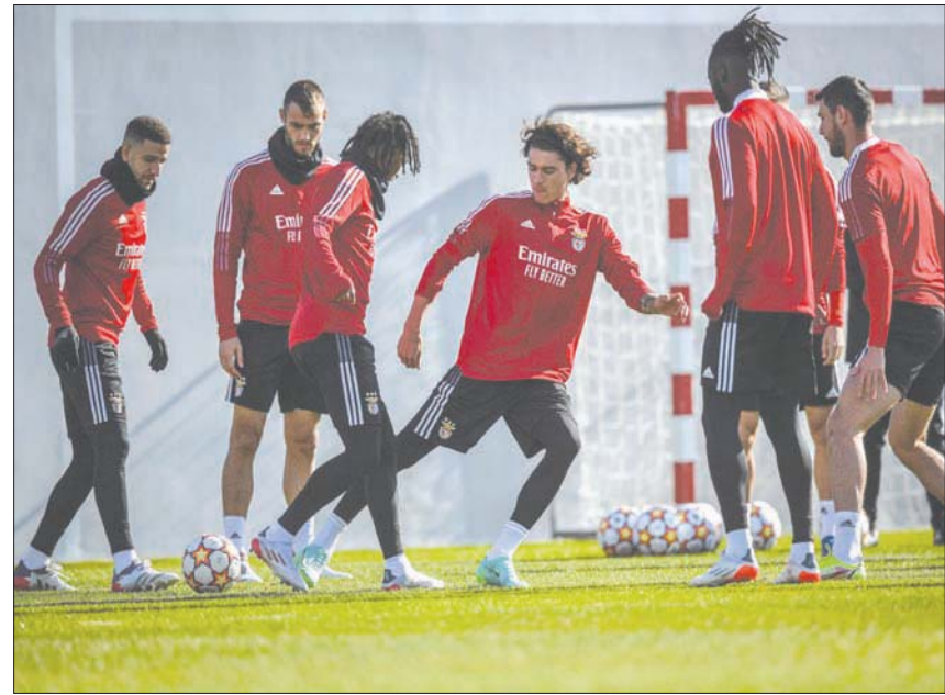
لاعبو بنفيكا خلال التدريبات استعداداً لموقعة أياكس الحاسمة

يعول مانشستر يونايتد الإنجليزي على الصحة الجيدة والسيرة الذاتية لنجمه البرتغالي كريستيانو رونالدو في مواجهة أتلتيكو مدريد الإسباني اليوم بإياب ثمن نهائي دوري أبطال أوروبا لكرة القدم، فيما يتبارز أياكس أمستردام الهولندي وبنفيكا البرتغالي على بطاقة ربع النهائي. وتعدال يونانيد، حامل اللقب ثلاث مرات آخرها 2008 بهدف متأخر للبدل السويدي أنطوني إيلانغا ذهاباً على أرض أتلتيكو 1 - 1 كما انتهت المباراة الثانية بالتعادل 2 - 2 في لشبونة.