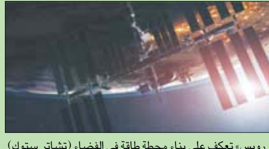
«رولز رويس» تعكف على بناء محطة طاقة في الفضاء