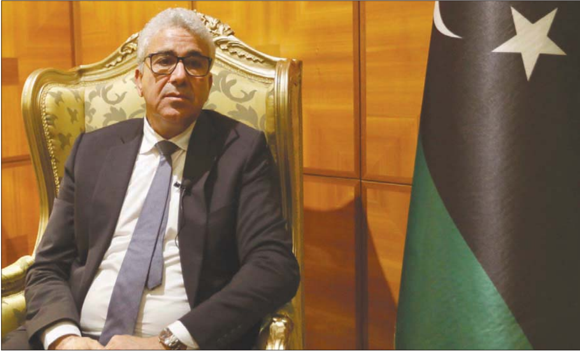
باشاغا أكد أمس أن حكومته لن تتورط في «أي عنف أو صراع» لدخول العاصمة

إلى ليبيا، مقر التجمع بالعاصمة طرابلس رفقة مسؤولين بحكومة الوحدة، تمهيداً لمباشرة أعماله من هناك. وتعهده مسؤولو حكومة «الوحدة» بتسهيل عودة عمل الأمانة التنفيذية للتجمع لمباشرة مهامها من مقره الدائم بطرابلس، وتجهيزه خلال الفترة القريبة القادمة، مع توفير البيئة المناسبة لعمل الاتحاد.