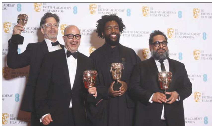
«صيف الصول» أفضل فيلم تسجيلي (أ.ب.)

إلى «شعب أوكرانيا» وإلى أولئك الذين يغطون الحرب، وكثير منهم أعضاء «باقتا». وخلال تقديم جائزة أفضل مخرج، قام الممثل أندري سركيس بتوجيه لوم إلى وزيرة الداخلية بريتي باتل لـ «تلكوهاها في الترحيب باللاجئين الأوكرانيين».