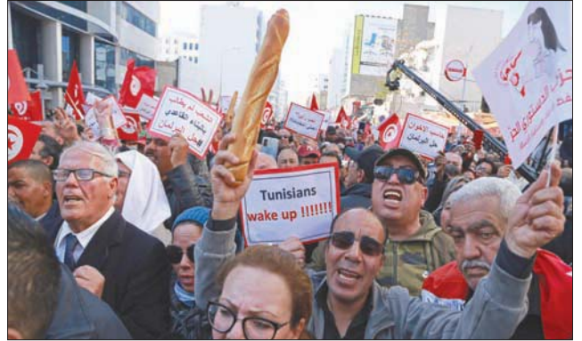
احتجاجات شهدتها العاصمة التونسية أول من أمس