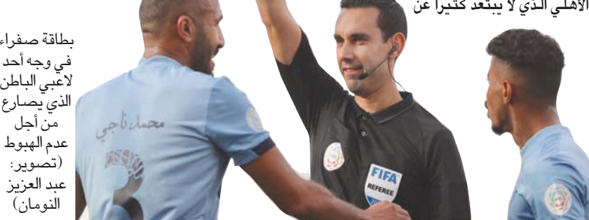
بطاقة صفراء في وجه أحد لاعبي الباطن الذي يصارع من أجل عدم الهبوط