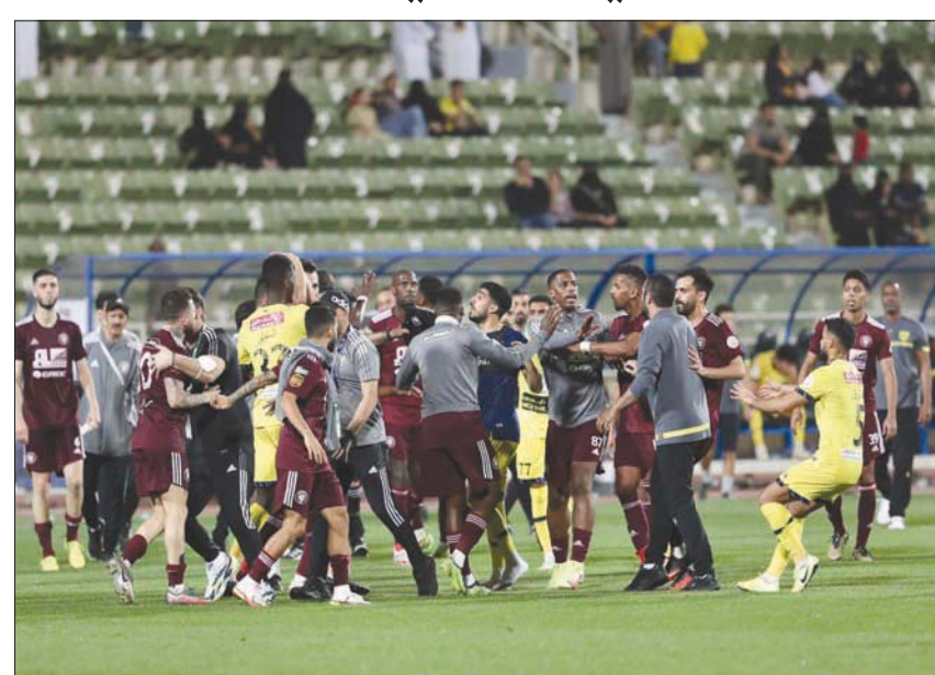
صورة اشتباك الأيدي بين فريقَي التعاون والفيصلي تعبر عن صراعهما من أجل البقاء في الدوري