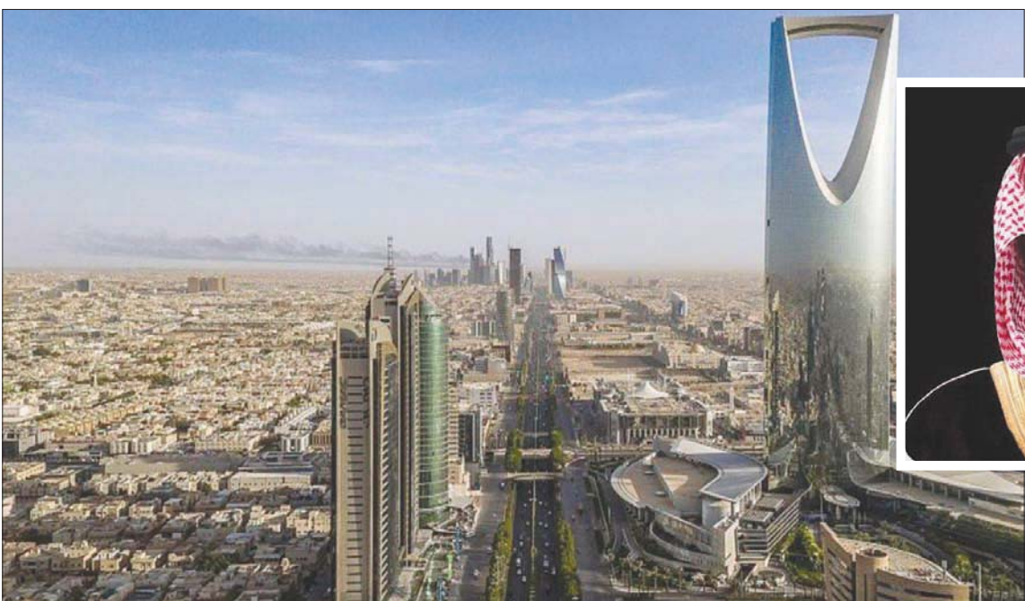
تهدف استراتيجية صندوق التنمية الوطني لدعم أهداف التنمية المستدامة لجميع القطاعات الاقتصادية (واس)

من حيث نسبة الأصول إلى الناتج المحلي الإجمالي في مجموعة اقتصاديات دول العشرين بأصول تصل إلى 496 مليار ريال سعودي. وقال محافظ صندوق التنمية الوطني ستيفن بول جروف، بخصوص إطلاق الاستراتيجية: «أماننا فرصة كبيرة لتعزيز كفاءة الصناديق والبنوك التنموية الحكومية من حيث تحديد فرص التمويل واستثمارها في جميع أنحاء المملكة، فضلاً عن تعزيز جهودها التعاونية بهدف مشاركة الخدمات والتحد من أوجه التداخل في عملياتها؛ مما سيسهم بشكل رئيسي في بناء مؤسسات مالية أكثر قوة واستدامة تعمل بأفضل الممارسات العالمية». وأضاف: «سيؤدي نجاح تنفيذ استراتيجية الصندوق إلى دعم جهود تحقيق ازدهار المملكة وتحسين جودة الحياة وإيجاد وظائف جديدة ومستدامة، والارتقاء بسمعة المملكة على الساحة الدولية في خطوة تؤدي إلى جذب مزيد من الاستثمارات الأجنبية. نحن اليوم أمام خطوة كبيرة، تضي بنا نحو تحقيق رؤية صاحب السمو الملكي الأمير محمد بن سلمان المستقبلي والمملكة ودورها الريادي في العالم».