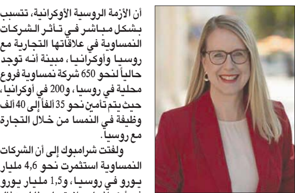
مارغريت شرابموك وزيرة الاقتصاد والشؤون الرقمية النسواوية (الشرق الأوسط)

الأمزمة الروسية الأوكرانية، تتسبب بشكل مباشر في تأثير الشركات النسواوية في علاقاتها التجارية مع روسيا وأوكرانيا، مبنية أنه توجد حالياً لنحو 650 شركة نسواوية قروء محلية في روسيا، و200 في أوكرانيا، حيث يتم تأمين نحو 35 ألفاً إلى 40 ألف وظيفة في النمسا من خلال التجارة مع روسيا.