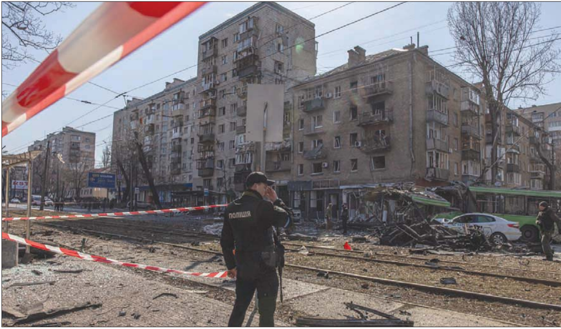
دمار في كييف بعد سقوط صاروخ روسي أمس في وقت يشعر حلف «الناتو» بالقلق بعد اقتراب المعارك من غرب أوكرانيا (أ.ب.)

وقال المسؤول الأطلسي، في إحاطة إعلامية مصغرة أمس في بروكسل، إن ثمة ارتياحاً نسبياً كان يسود أوساط الحلف لكون المعارك تدور بشكل أساسي في المناطق الشرقية من أوكرانيا خلال الأيام الأولى من الغزو، وإن ابتعاد هذه المناطق عن حدود الاتحاد الأوروبي والحلف الأطلسي كان يحول دون صدام عرضي بين القوات الروسية والأطلسية أو هجوم مفاجئ