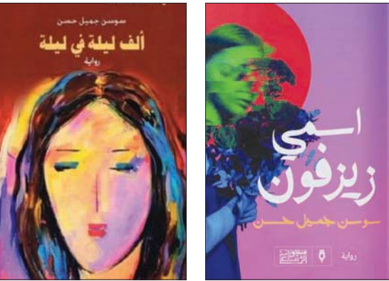
غلاف الرواية الجديدة