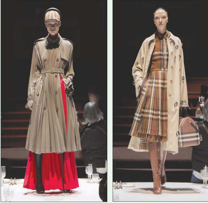
أخذ المعطف تصاميم جديدة منها تحوله إلى فساتين للنهار والمساء على حدٍ سواء