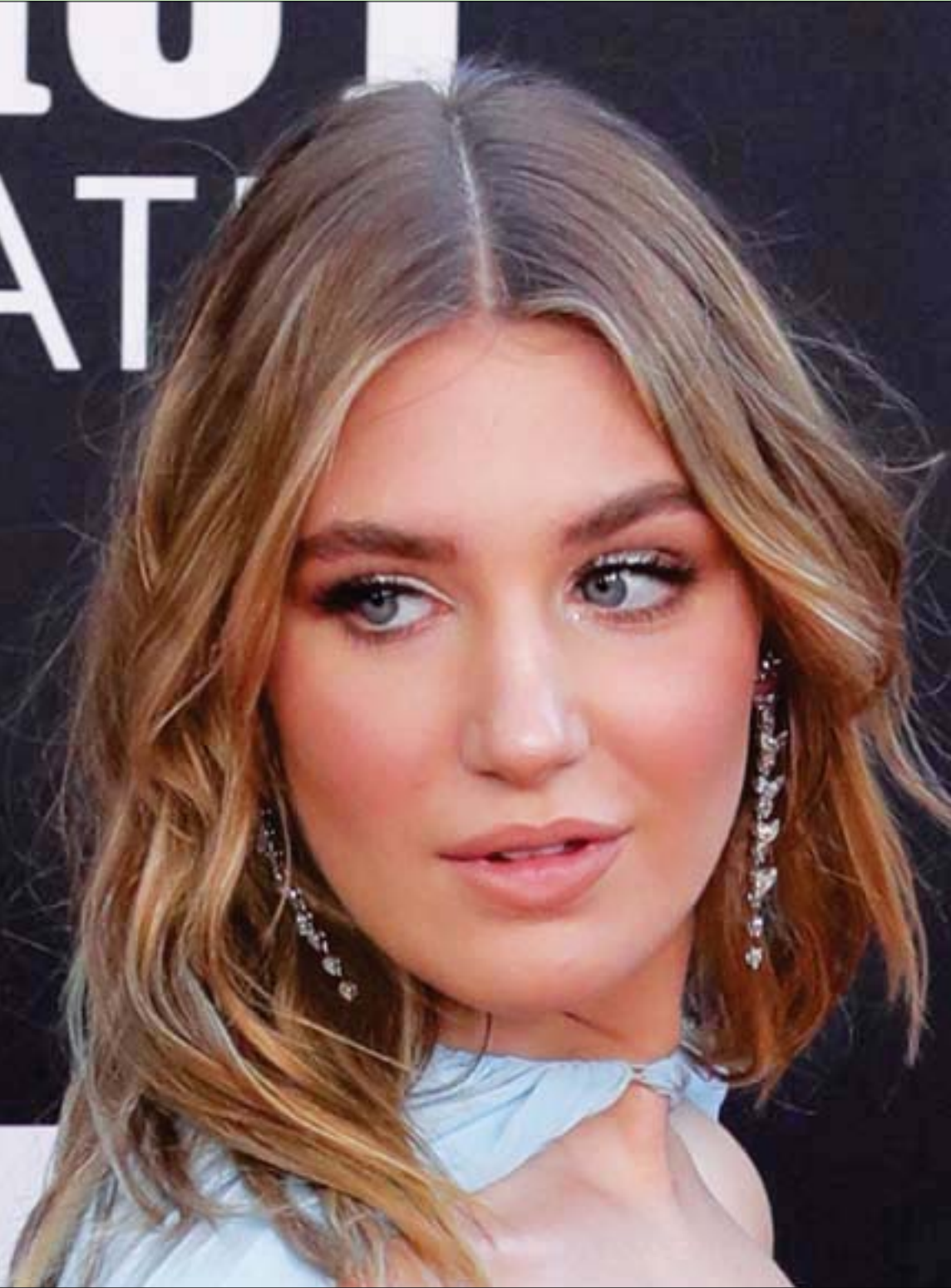
الممثلة الكندية صوفي نيليس تحضر توزيع جوائز اختيار النقاد السابع والعشرين في لوس أنجليس بكاليفورنيا

وقد ضربا رقماً قياسياً في طول مدة زواجهما من دون كلل أو ملل - أه، يا حسرة علينا.