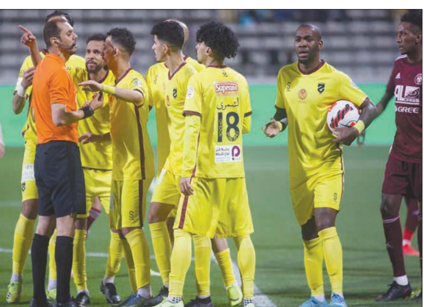
لاعبو الحزم... الفريق الأكثر تهديداً بالهبوط لدوري الأولى يتجمعون على حكم المباراة