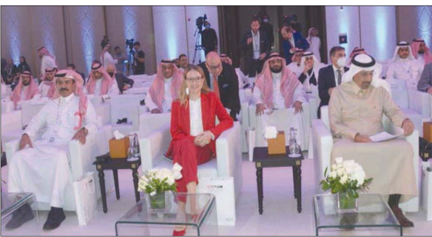
جانب من المنتدى النسواي الاستثماري المنعقد في الرياض أمس

التحول الرقمي يمثل تحدياً مشتركاً عالمياً، مبنية أن بلادها تتمتع بكافة أدوات الذكاء الصناعي والحوسبة السحابية، والتطورات الجديدة. وكشفت شرابموك، أن بلادها تطبق