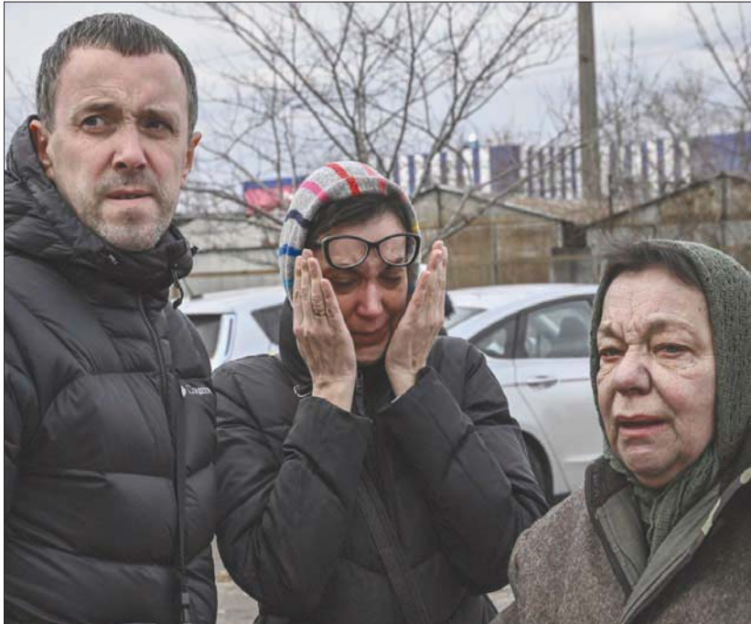
أوكرانيون في حالة حزن بعد قصف طاك عمارة وأسفر عن قتلين على الأقل في كييف أمس (أ.ف.ب)

مستمر. سبب الخلاف هو أن لدينا أنظمة سياسية مختلفة للغاية». وكان بودولياك حدد أولويات بلاده في هذه الجولة، وقال إنها تتناول قضايا «وقف إطلاق النار وسحب القوات الروسية والضمانات الأمنية». وفي الوقت ذاته، أعلن زيلينسكي أنه كلف الوفد المفاوضات التوصل إلى نتيجة مع الجانب الروسي حول عقد لقاء مباشر مع الرئيس الروسي. وكرر الإعراب عن قناعته بأن «تحقيق تقدم جدي مرهون بجلوس وجهاً لوجه