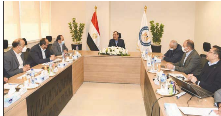
الاجتماع الأول لوزارة البترول المصرية في مقرها بالعاصمة الإدارية الجديدة (الحكومة المصرية)

التي تعكس الشكل الحضاري للجمهورية الجديدة لتبني دولة متكاملة تتميز بالحداثة والتطور والتحول الرقمي في كافة قطاعاتها، تنفيذاً لرؤية التنمية استخداماً مصر 2030». وتطرق الاجتماع الوزاري، أمس، إلى «برنامج تعظيم الاعتماد على الغاز الطبيعي كوقود للسيارات، وموقف المحطات الجديدة المتبعي تنفيذها ضمن خطة الألف محطة والإسراع بتنفيذها»، فضلاً عن «الإسراع في الانتهاء من إنشاء مراكز تحويل السيارات وفقاً للبرامج الزمنية المحددة لتلبية احتياجات المواطنين الراغبين في تحويل سياراتهم للعمل بالغاز والتي زادت أعداد المستفيدين بها لنصل إلى 500 ألف سيارة حتى الآن». وفي شأن عمل الوزارة في العاصمة الجديدة، أفاد البيان الحكومي، أنه «تم تحويل الغاز الطبيعي لمعظم المناطق بالعاصمة الإدارية، وتنفيذ التركيبات الخارجية للمباني