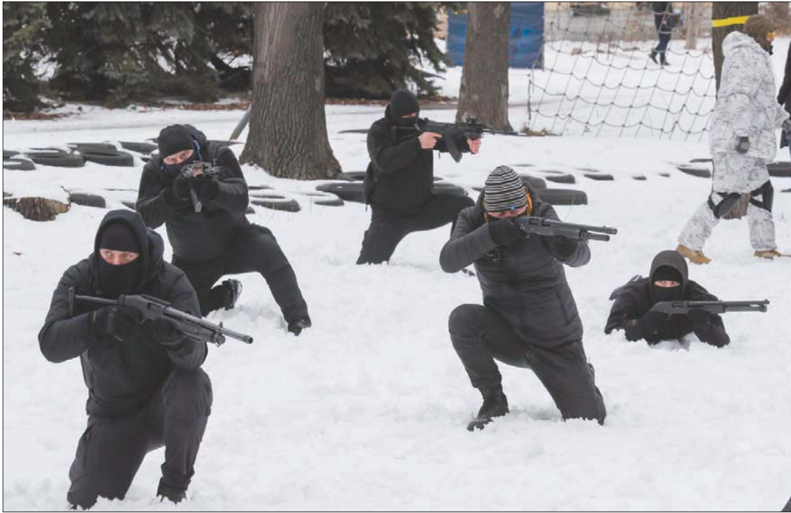
مدنيون أوكرانيون يتلقون تدريبات عسكرية في كييف أمس (إبأ)

الأسبوع الماضي، حذر رئيس هيئة الأركان الأمريكية المشتركة الجنرال مارك ميلي من أن العاصمة الأوكرانية كييف قد تسقط في غضون 72 ساعة إذا حدث غزو روسي واسع النطاق لأوكرانيا، فيما أعلن مسؤولون أميركيون أن الاستخبارات الأميركية تعتقد أن روسيا تكثف استعداداتها العسكرية لتنفيذ غزو واسع النطاق لأوكرانيا، وأنه بات لديها فعليا 70 في المائة من القوة اللازمة لتنفيذ هذه العملية خلال الأسابيع القادمة. وقال المسؤولون إنه إذا اختارت موسكو اللجوء إلى غزو واسع، فيمكن لقواتها تطويق العاصمة الأوكرانية كييف والإطاحة بالرئيس فولوديمير زيلينسكي في غضون 48 ساعة. في غضون ذلك، اعتبرت الرئاسة الأوكرانية أمس أن فرص إيجاد «حل دبلوماسي» للآزمة مع روسيا «أكثر بكثير» من مخاطرة «تصعيد» عسكري. وقال