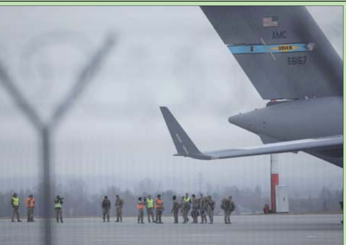
طائرة من طراز سي-17 تابعة ل سلاح الجو الأميركي بعد هبوطها في مطار رزيوزو- جاسيونكا ببولندا أمس حاملة تعزيزات عسكرية