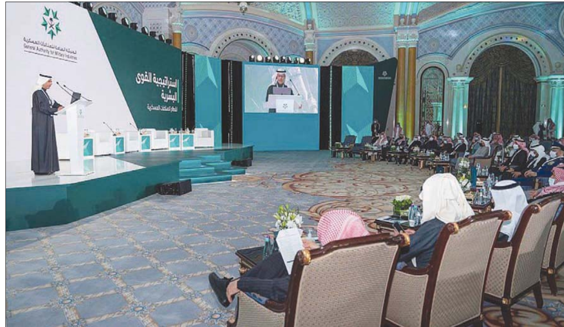
الإعلان عن استراتيجية القوى البشرية في توظيف الصناعات العسكرية السعودية أمس

والتنمية الاجتماعية، أن الهيئة العامة للصناعات العسكرية منذ يومها الأول وضعت استراتيجية لالقوى البشرية وسيكون هناك عمل تكاملي معها على خطط توظيف القطاع، وكشف الراجحي عن تجاوز عدد السعوديين في القطاع الخاص 1.9 مليون مواطن، مما يثبت أن الكوادر الوطنية نجحت في كافة مناحي الاقتصاد، كاشفاً في الوقت ذاته عن دخول ما يقارب 400 ألف شاب وشابة سعودية إلى سوق العمل خلال العام المنصرم، مما يعطي مؤشراً على الرغبة الجادة للمشاركة في برامج الرؤية 2030. وأضاف أن الوزارة أطلقت خلال العام المنصرم، إلى ضرورة سدّ الفجوات واحتياجات سوق العمل بالمملكة في العديد من المجالات من أبرزها الصناعات العسكرية والدفاعية وتطوير منظومة القيم عبر تطوير جاهزية من هم على رأس العمل.