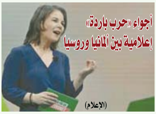
أجواء «حرب باردة» إعلامية بين ألمانيا وروسيا