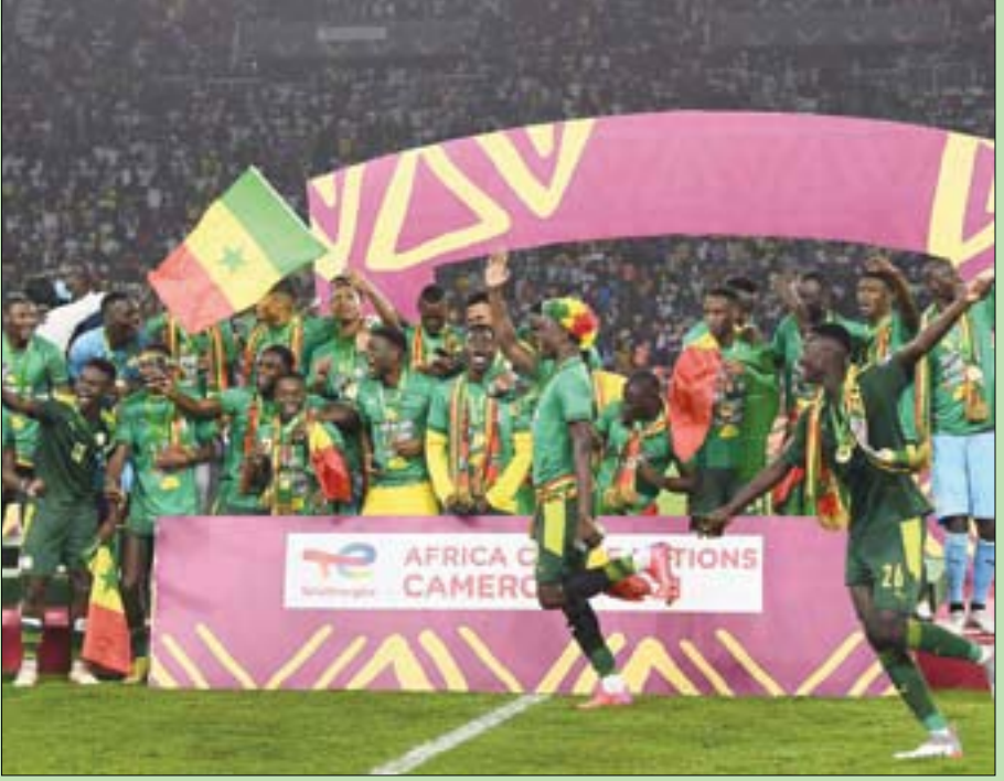
بركلات الترجيح... لاعبو منتخب السنغال يرقصون فرحاً بتتويج بلادهم بكأس أمم أفريقيا للمرة الأولى في تاريخها بعد تغلبها على مصر بركلات الترجيح (2-4) في النهائي على ملعب «أوليمبي» بالعاصمة الكاميرونية ياوندي أمس (أ.ف.ب) (تفاصيل عالم الرياضة)

الذين يسئون إلى رسالة القضاء واستقلاله بتلويحه السياسي والطائفي والمذهبي، ويجعله غب ففن غير المقبول إطاحة استقلالية القضاء وهيته وكرامته. فيضع القضية بفقدون استقلاليتهم ويخضعون للسلطة السياسية داخل القضاء». من ناحية ثانية، تعود مفاوضات ترسيم الحدود البحرية بين لبنان وإسرائيل إلى الواجهة هذا الأسبوع مع زيارة يقوم بها المبعوث الأميركي أموس هوكشتاين إلى بيروت، وتقول مصادر مطلعة على زيارة المبعوث الأميركي إنه قد يصل إلى بيروت مساء الثلاثاء أو صباح الأربعاء لاقفة لـ«الشرق الأوسط» إلى أنه سيحمل صيغة جديدة كان قد بحثها مع الإسرائيليين.» (تفاصيل ص 6)