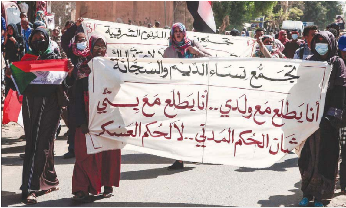
الخروطوم، محمد أمين ياسين

اتفق قادة دول هيئة التنمية الإفريقية «الإيقاد» على عقد قمة على مستوى رؤساء الدول والحكومات بشأن الأوضاع في السودان في غضون الأسابيع المقبلة. واستمع القادة، على هامش قمة الاتحاد الأفريقي في أديس أبابا أمس، إلى تقرير بعثة «الإيقاد» برئاسة السكرتير التنفيذي، وركنة قبیهو، التي زارت السودان الأسبوع الماضي. في غضون ذلك، التقى عضو مجلس السيادة الانتقالي السوداني، مالك عقار إير، في القصر الجمهوري بالخروطوم أمس سفراء دول الإيقاد المقيمين بالبلاد، وأبلغهم بتطورات العملية السلمية، والجهود التي تبذلها الحكومة الانتقالية لتعزيز السلام والاستقرار في السودان. وأكد عقار للسفراء أن بلاده تتطلع إلى دعم ودور فاعل من منظمة الإيقاد لتسريع العملية السلمية في السودان.