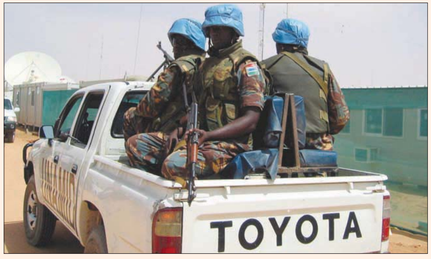
صورة أرشيفية لقوات «يوناميد» في مدينة الفاشر بدارفور

ويعيش نحو 2,5 مليون شخص في مخيمات النزوح في دارفور بسبب الصراعات المسلحة المتكررة منذ عهد الرئيس المعزول عمر البشير.