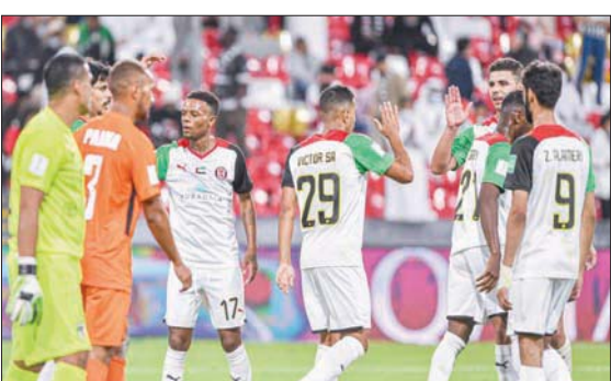
لاعبو الجزيرة الإماراتي يحتفلون بأحد أهدافهم في المواجهة

تعرض لإصابة قوية خلال المران الجماعي ونقل مستشفى للخضوع لفحوص وتحديد نوع الإصابة ومدتها والغياب المحتملة. ويقد بطل أفريقيا جهود الحارس محمد الشناوي والمدافعين أكرم توفيق ويدر بانون والمهاجم بيرسي تاو للإصابة بجانب حمدي فتحى وأيمن أشرف وعمرو السولية ومحمد شريف لمشاركتهم مع منتخب مصر في كأس الأمم الأفريقية بالكاميرون. كما أصيب المدرب الجنوب أفريقي بيتسو موسيماني بغيروس كورونا.