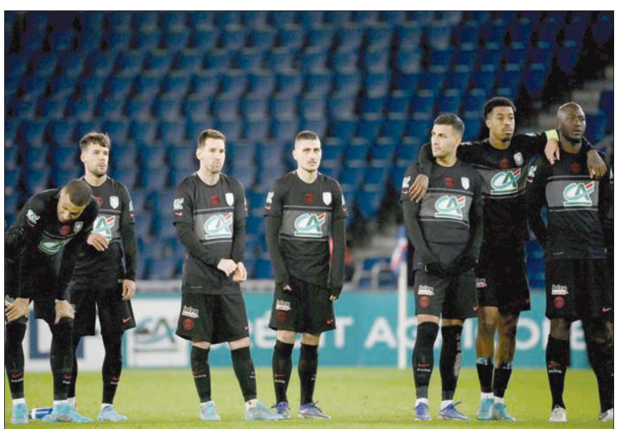
سان جيرمان والخسارة أمام نيس في مسابقة الكأس

المهدد بالإقالة لا سيما في حال عدم تخطي زبال مدريد في المسابقة القارية العريقة، على تغاؤه بقدرة فريقه على تحسين مسنواه بقوله بعد الخروج أمام نيس: «استمر برؤية الأمور بشكل إيجابي، كنا نستحق الفوز لكننا لم نحسن ترجمة الفرص الكثيرة التي تحدث لنا وافتقدنا الفاعلية أمام المرمى».