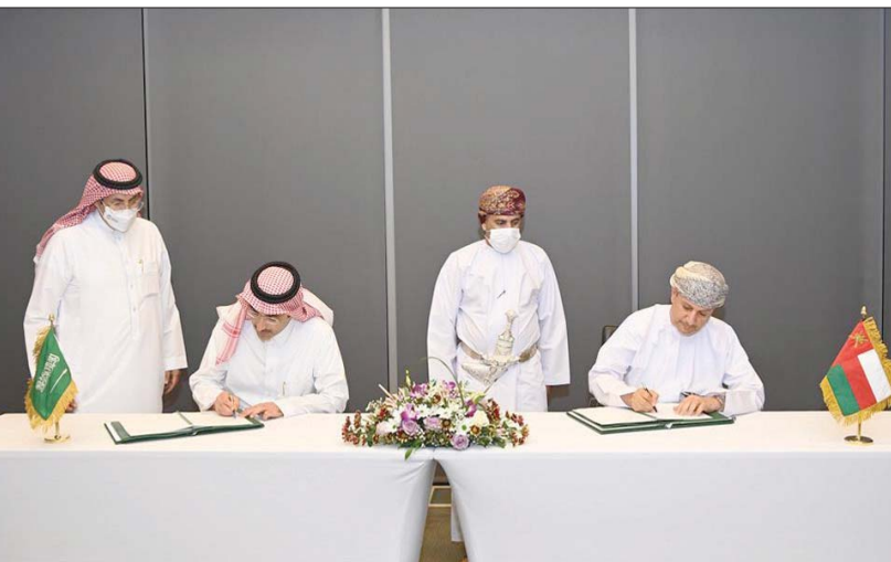
وزير المالية العماني مع الرئيس التنفيذي السعودي للتنمية يوقعان مذكرات التفاهم

السعودي للتنمية «إن جهود السعودية من خلال إسهامات الصندوق السعودي للتنمية في توقيع هذه المذكرات تهدف إلى تعزيز التعاون المشترك بين البلدين، وانطلاقاً من الدور الذي يلعبه الصندوق في دعم مسارات التنمية الاجتماعية والاقتصادية في البلدان العربية والإسلامية». يذكر أن الصندوق السعودي للتنمية يعمل منذ حوالي 45 عاماً على تمويل ودعم المشاريع التنموية في عُمان، وتأتي تلك المشاريع لدعم قطاعات البنية الأساسية، وبرنامج التعليم العالي والمهني، وقطاع المياه، بالإضافة إلى المشاريع الإنشائية في قطاع الطاقة.