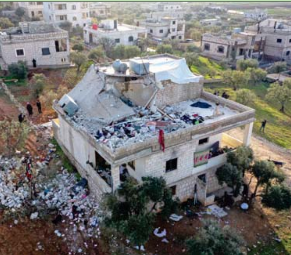
أشخاص يعاينون المنزل الذي تمت بداخله عملية قتل زعيم «داعش» في إدلب وفي الإطار صورة قديمة له

واشنطن، هبة القديسي وجهدت الولايات المتحدة، ضربة قوية جديدة لتنظيم «داعش»، بقتلها زعيمه أبو إبراهيم الهاشمي القرشي بعملية نفذتها قوة كوماندوز في محافظة إدلب السورية. وأعلن الرئيس جو بايدن أن واشنطن «أزاحت» زعيم «داعش» القرشي في عملية إنزال جوي نفذتها قوات أميركية خاصة في ريف إدلب شمال غربي سوريا ليل الأربعاء - الخميس، مؤكداً عودة جميع الجنود الأميركيين سالمين. وقال مسؤول كبير في البيت الأبيض إنه عند بدء العملية التي استهدفت القرشي في بلدة أطمه بريف إدلب قرب الحدود التركية، «فجر الهدف الإرهابي قنبلة مما أدى إلى مقتل مع أفراد عائلته وبيئهم نساء وأطفال». وأحصى «المركز السوري لحقوق الإنسان» 13 شخصاً على الأقل بينهم أربعة أطفال وثلاث نساء قُضوا خلال العملية التي بدأت بإنزال جوي، واستمرت لأكثر من ساعتين، تخللها إطلاق رصاص واشتباكات، دمرت مروحية في ريف حلب تعرضت لعتل، بعد مشاركتها في الإنزال واستهدفت العملية الأميركية، مبنى من طابقين في أرض محاطة بأشجار الزيتون. وتضرر الطابق العلوي منه بشدة وغطى الدخان الأسود سقفه الذي انهار جزء منه. وتبعثت محتويات المنزل الذي انتشرت بقع دماء في أنحاءه. وتداول سكان ليلاً تسجيلات صوتية خلال العملية، يطلب فيها متحدت باللغة العربية من النساء والأطفال إخلاء المكان المستهدف. وكان القرشي قد تسلّم قيادة التنظيم خلفاً لأبو بكر البغدادي، الذي قتل هو الآخر بعملية عسكرية أميركية في باريشا التابعة لإدلب في 27 أكتوبر (تشرين الأول) 2019 في عهد الرئيس السابق دونالد ترامب. ومنذ تسلمه مهامه خلفاً للبغدادي، لم يظهر القرشي علناً أو في أي من إصدارات التنظيم الإرهابي ولا يعرف الكثير عنه أو عن تفرقاته. (تفاصيل ص 6)