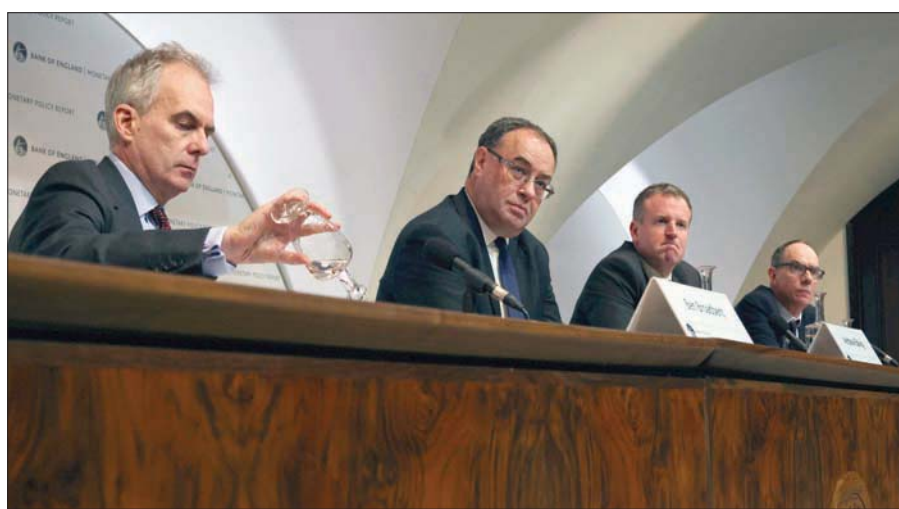
رفع بنك إنجلترا المركزي أسعار الفائدة الخميس لاحتواء ضغوط الأسعار (أ.ب.)

في الأفق شكل خطير لدوامه الأسعار والأجور، التي يمكنها أن ترفع معدلات التضخم بشكل مستمر. وأضافت لاغارد، أن ذلك لن يوقف التضخم حتى تلك اللحظة تشير إلى احتمال خروج تطور معدل التضخم عن السيطرة، من خلال هذه الدوامة، «بل على العكس، نحن نتوقع أن أسعار الطاقة ستستقر على مدار عام 2022، وعندئذ ستراجع معدلات التضخم تدريجياً».