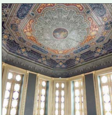
جانب من زخارف القصر الفريدة

لوظفي القصر والحراسة، بالإضافة إلى سرايا الفسقية، التي تتكون من حوض ماء كبير، يشبه البحيرة، بتوسط نافورة، وتحيط بها 4 قاعات الأركان في قاعات الطعام والأسماء والعرش والبلياردو، كما يضم القصر سرايا الجبلية التي شهدت إدخال نظام الإضاءة الحديثة، ضمن مشروع التطوير.