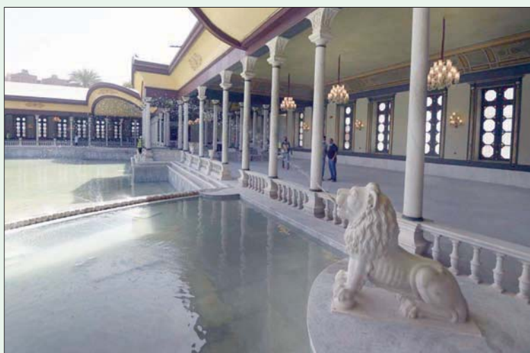
زاوية أخرى من حوض سرايا الفسقية