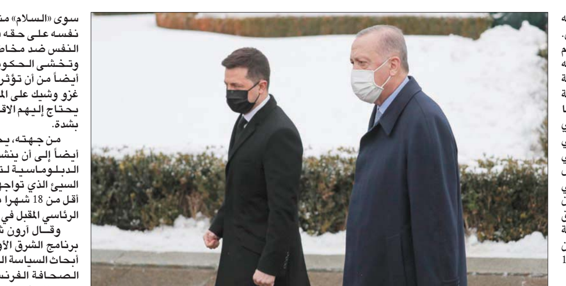
الرئيس التركي (يمين) مع نظيره الأوكراني في كييف أمس

سوى «السلام» مشددا في الوقت نفسه على حقه في الدفاع عن النفس ضد مخاطر غزو روسي. وتخشى الحكومة الأوكرانية أيضاً من أن تؤثر الشائعات عن غزو وشيك على المستثمرين الذين يحتاج إليهم الاقتصاد الوطني بشدة. من جهته، يحتاج أردوغان أيضاً إلى أن ينشط على الساحة الدبلوماسية لتجاوز الوضع السيئ الذي تواجهه حكومته قبل أقل من 18 شهراً من الاستحقاق الرئاسي المقبل في 2023. وقال أرون شتاين مدير برنامج الشرق الأوسط في معهد أبحاث السياسة الخارجية لوكالة الصحافة الفرنسية إن «انقرة تسعى للحفاظ على علاقات وثيقة مع موسكو وكييف»، موضحاً أنه «في الوضع الحالي، يسعى أردوغان إلى القيام بما تعرف حلفاء تركيا الأذربيجانيين في ناغورني قره باغ. وبينما يتوافد الزوار الغربيون على كيبف لدعم الرئيس الأوكراني، أكد زيلينسكي الأربعاء أنه لا يريد