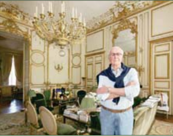
في صالونه الأخضر الشهير

النادرة، والمزاد الذي سيمتد على عدة أيام من شهر يونيو (حزيران) المقبل يثير شهية جامعي التحف، ومدبري المتاحف، نظراً لضخامته واحتوائه على أكثر من ألف قطعة. جيفنشي، الذي رحل في ربيع 2018، كان الخياط الذي ترك بصمته على أشهر أنيقات النصف الثاني من القرن العشرين من فنانات وأميرات، واشتهر بأنه كان