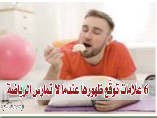
6 علامات توقع ظهورها عندما لا تمارس الرياضة