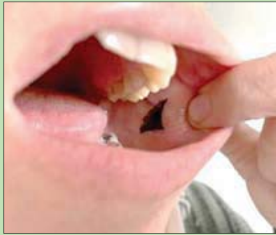
نموذج لللاصق داخل الخد

القاهرة، حازم بدر تتطلب إدارة مستويات السكر في الدم اهتماماً على مدار الساعة، ويحتاج الكثير من المصابين بمرض السكري إلى جرعات منتظمة من الإنسولين، وهو «الهرمون الأساسي الذي ينظم السكر»، ولايصال هذا الدواء بطريقة أقل توعلاً، أبلغ الباحثون بجامعة «ليل» بفرنسا في دراسة نشرت أول من أمس دورية «إيه سي إس إبيلايد بيو ماتريليز»، عن نموذج أولي لللاصق محمّل بالإنسولين يلتصق بشكل مريح داخل فم الشخص. ويأخذ الناس الإنسولين بشكل أساسي عن طريق حقن أنفسهم