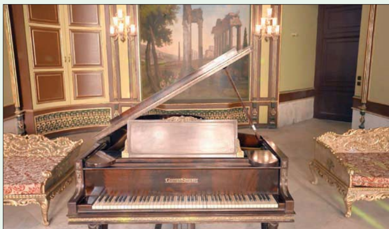
بيانو نادر داخل إحدى قاعات القصر (وزارة السياحة والآثار المصرية)

وحسب الهيئة العامة للاستعلامات المصرية، فقد أُعيد افتتاح قصر محمد علي بشبرا الخيمة، بعد الانتهاء من مشروع ترميم نغذته وزارة الثقافة، بتكلفة 50 مليون جنيه، وتضمن إزالة 52 مبنى لوزارة الزراعة، كانت تحتل جزءاً من حديقة القصر، إضافة إلى أعمال ترميم إنشائي ومعماري وترميم للزخارف الموجودة في القصر، واستخدم القصر بعد ذلك في عدد من الحفلات الرسمية والخاصة، وتعرض لمحاولة سرقة 9 من لوحاته عام 2009 عام استُردت فيما بعد، وأُغلق القصر عام 2011، في أعقاب أحداث 25 يناير (كانون الثاني)، وفي عام 2015 سقط جزء من سقفه، نتججة تأثره بانفجار في مبنى الأمن الوطني المجاور له بشبرا الخيمة.