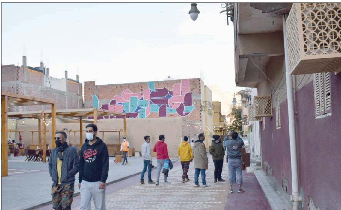
ساحة للفنون تقدم ورش العمل الحرفية في «الجديدة»

الحليب الطازج لا يُستخدم في تحضير الأطعمة، بل يستبدلن به حليب اللوز أو حليب الصويا أو حليب جوز الهند، حسب اختيار الزبون. والأم ذاتة مع الشاي الأحمر المفقود، والذي يُستعاض عنه بنشاي الماتشا الياباني الأخضر، مما يجعل الزائر يشعر فعلياً بأنه جُزِبَ شيئاً مختلفاً عن المعتاد.