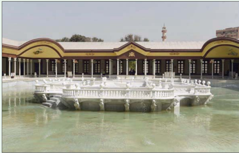
حوض سرايا الفسقية في قصر محمد علي (وزارة السياحة والآثار المصرية)