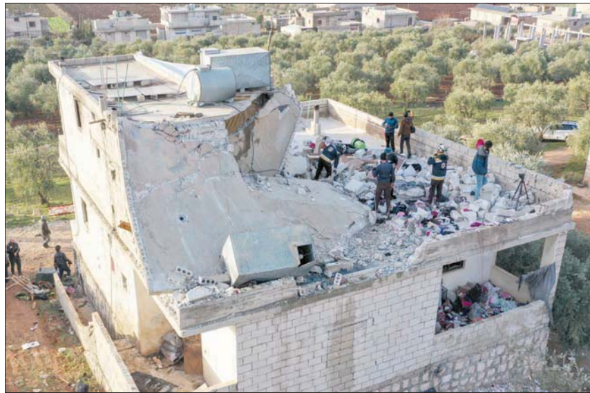
عناصر الدفاع المدني السوري يتفقدون سطح المنزل بعد عملية الإنزال الأميركية ليل الأربعاء - الخميس

البغدادي، ويعرف أيضاً باسم أمير محمد سعيد عبد الرحمن المولى. وقد أعلنت وزارة العدل الأميركية قبل عامين مكافأة 10 ملايين دولار للمعلومات تؤدي إلى تحديد موقعه. وبحسب المعلومات المتوفرة عن القرشي، الذي خلف البغدادي، في قيادة «داعش»، فهو من مدينة نينوى العراقية وانضم إلى «داعش» عام 2003. وفي عام 2008 داهمت القوات الأميركية منزله في الموصل وقامت باعتقاله وسجنه في معسكر بوكا، وهو مركز احتجاز كانت تديره الولايات المتحدة وتعرض القرشي لجلسات استجواب مكثفة من المحققين الأميركيين. وفي عام 2009 بعد توقيع اتفاقية إنهاء الحروب العسكرية في العراق خلال عهد الرئيس أوباما، تم إطلاق سراح المعتقلين في السجون التي كانت تديرها الولايات المتحدة وأطلق سراح القرشي.