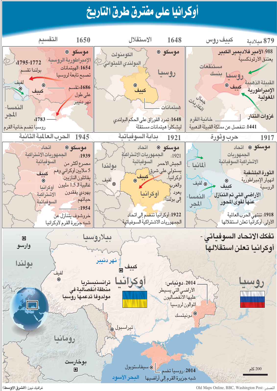
تفكك الاتحاد السوفياتي - أوكرانيا تعلن استقلالها

ماكرون الهدف الذي يسعى إليه من مبادرة كهذه التي ستكون، في حال حصولها، الأولى لرئيس دولة غربية، بخصوص القضية الأوكرانية في احتواء التصعيد وإيجاد السبل السياسية للخروج من الأزمة، وهذا يستدعي القدرة على المضي قدماً على أساس اتفاقات مينسك» المبرمة عامي 2014 و2015 من أجل وضع حد للاشتباكات بين الانفصاليين والحكومة المركزية في كييف. ويربط ماكرون بين تحركاته الراهنة وبين اعتباره أنه «لن يكون هناك نظام أمن واستقرار في أوروبا إذا لم يكن الأوروبيون قادرين على الدفاع عن أنفسهم وبناء حل مشترك مع جميع جيرانهم وبينهم الروس». ليس سرا أن ماكرون يريد الاستفادة من العلاقة التي نسجها مع الرئيس بوتين منذ وصوله إلى قصر الإليزييه ربيع العام 2017 حيث دعاه مرتين لزيارة فرنسا؛ الأولى في العام المذكور، إلى قصر فرساي الشهير، الواقع غرب باريس، والثانية صيف العام 2019 إلى المنتجع الرئاسي الصيفي في حصن بريغونسون، المطل على المتوسط قبيل قمة مجموعة السبع التي كانت ترأسها فرنسا ذلك العام كذلك سعى ماكرون مع المستشار الألمانية السابقة إلى إقناع الأوروبيين، ربيع الماضي، بعقد قمة أوروبية - روسية، إلا أنهما لقيتا معارضة قوية من دول أوروبا الشرقية، مما أجهض مبادرتهم. رسمية في باريس، فإن ماكرون يسعى إلى تثبيت امرين؛ الأول، التأكيد على تضامن فرنسا مع أوكرانيا وعلى وحدة الموقف الأوروبي والأطلسي وردة الفعل الجماعية على روسيا في حال غزت أوكرانيا. والثاني، التشديد على أهمية الحوار واعتبار أن الحل يجب أن يكون سياسياً وعبر العمل الدبلوماسي. والمدخل المثالي لذلك يكمن، وفق الرؤية الفرنسية، في تفعيل «صيغة نورماندي» التي عقدت