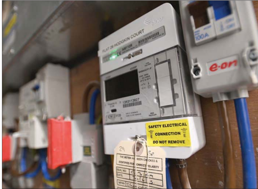
قالت «شل» إنها ستدعم الاحتياجات الغازية الأوروبية حال توقف ضخ الغاز الروسي (إ.ب.أ)

في ذات الوقت خطط «شل» لإنفاق مليارات الدولارات على برنامج إعادة شراء الأسهم، وذلك بعد تعاف قوي لأعمالها العام الماضي. وأعلنت الشركة