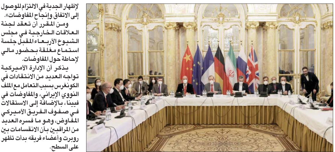
جانب من مفاوضات فيينا النووية مع إيران في ديسمبر الماضي

لإظهار الجدية في الالتزام للوصول إلى الاتفاق وإنجاح المفاوضات. ومن المقرر أن تعقد لجنة العلاقات الخارجية في مجلس الشيوخ الأربعاء جلسة استماع مغلقة بحضور صالي لإحاطة حول المفاوضات. يذكر أن الإدارة الأميركية تواجه العديد من الانتقادات في الكونغرس بسبب التعامل مع الملف النووي الإيراني، والمفاوضات في فيينا، بالإضافة إلى الاستقالات في صفوف الفريق الأمريكي المخافض، وهو ما فسره العديد من المراقبين بأن الانقسامات بين روبرت وأعضاء فريقه بدأت تظهر على السطح.