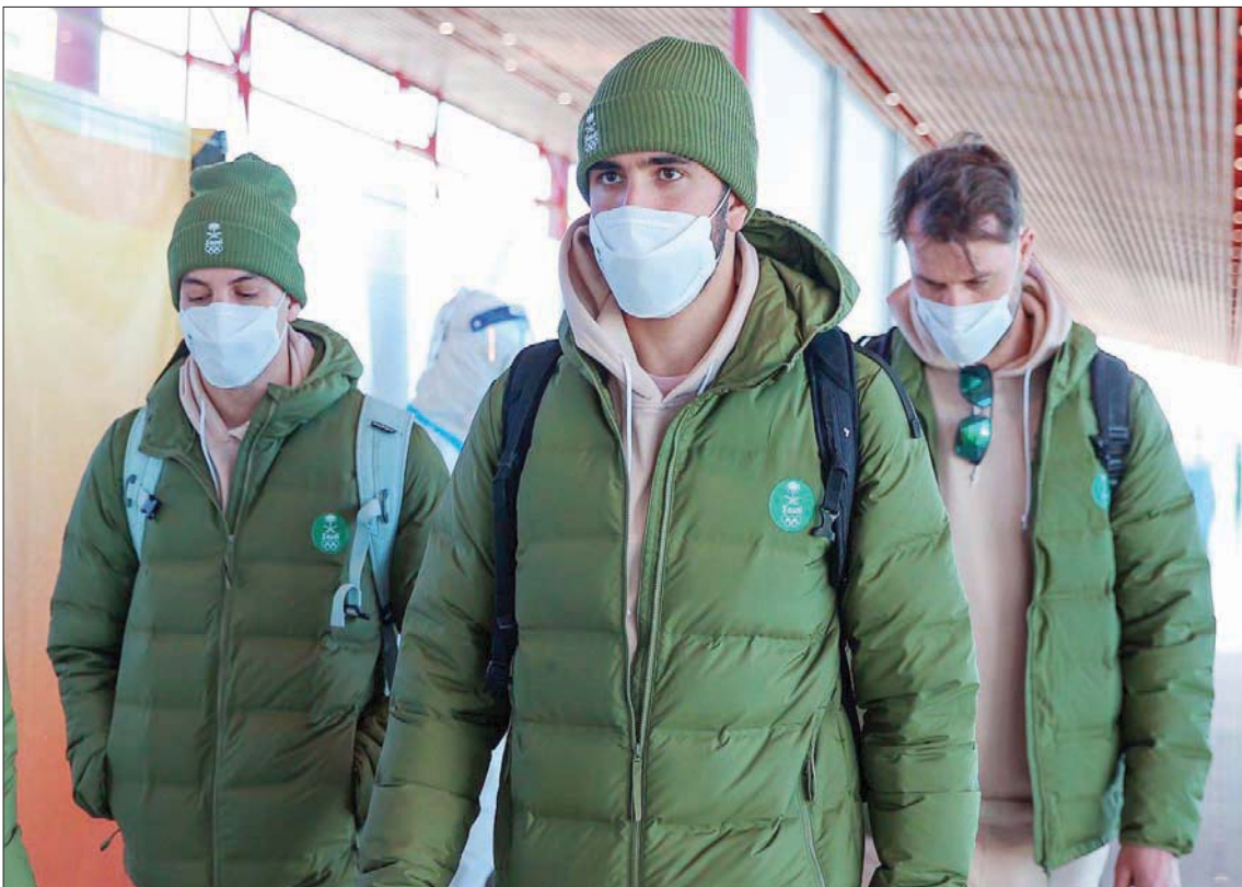
فايق عابدي لدى وصوله إلى بكين كأول سعودي يمثل الوطن في الألعاب الشتوية

هل هناك أماكن لممارسة التزلج نشر الألعاب الشتوية؟ تم استئجار صالة في جدة وتوجد صالة ثالثة في الرياض يتم العمل على استئجارها. أما بالنسبة للتزلج على الثلج فسيكون هناك صالة تزلج في مول الرياض من شركة الفطيم خلال 48 شهراً كما أن صالات أخرى سيتم إنشاؤها من شركة سفن في الرياض والشرقية وجدة أندري سكي ريزورت.