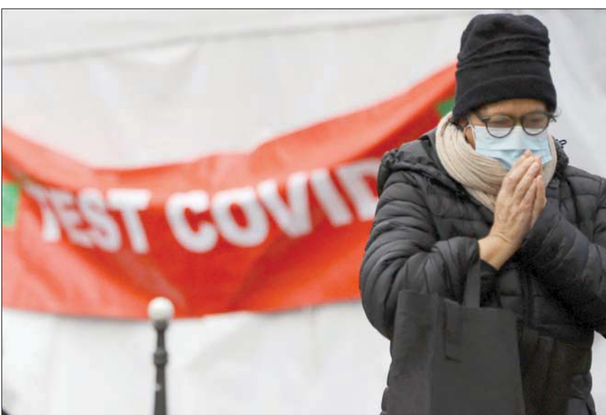
سيدة ترتدي كمامة وهي تمر بالقرب من مركز فحص متنقل في باريس أمس (رويترز)