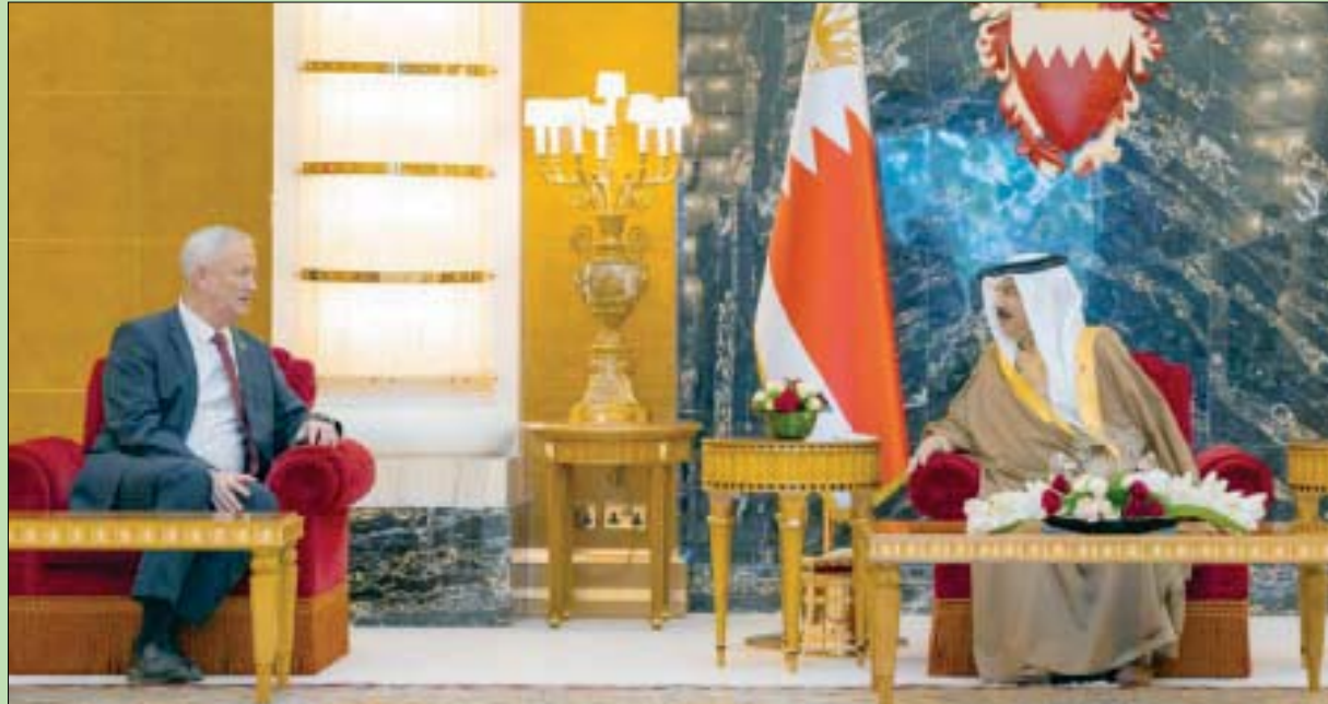
العاهل البحريني الملك حمد بن عيسى آل خليفة لدى استقباله وزير الدفاع الإسرائيلي بني غانتس في قصر الصخير أمس

عن سيادة شركائنا الإقليميين بالإضافة إلى السلام والاستقرار في المنطقة». وتضيف غانتس في بيان «بعد إجراء غانتس، وهو أول وزير دفاع إسرائيلي يزور البحرين، جولة على متن المدمرة الأمريكية «يو إس إس كول»، وقال وزير الدفاع الإسرائيلي بني غانتس أمس الخميس إن إسرائيل ستواصل تعزيز الأواصر مع الولايات المتحدة ومع دول المنطقة، وذلك في ختام زيارته لقر قيادة الأسطول الخامس الأمريكي في البحرين، ضمن زيارته الرسمية للمنامة التي وصلها أول من أمس. وقالت هيئة البث الإسرائيلي إن غانتس أكد أهمية تعزيز العلاقات الاستراتيجية بين إسرائيل والولايات المتحدة، وتشارك إسرائيل هذا الأسبوع في تدريبات بحرية تقودها الولايات المتحدة وتشارك فيها 60 دولة في الشرق الأوسط.