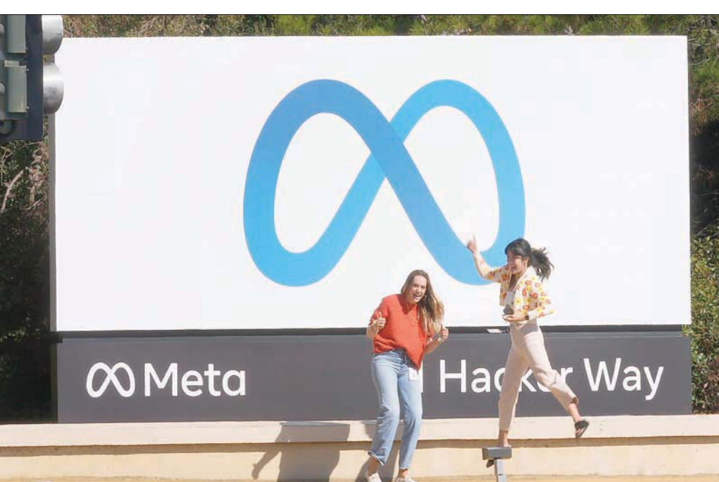
موظفتان من «فيسبوك» تأخذان صورة تذكارية أمام لوغو واسم الشركة «ميتا»

وعلق المحلل الاقتصادي روب إندرله قائلاً: «عندما تظهر شركة أنها فشلت في تحقيق أهدافها، يشير الأمر إلى إمكاناتها التنفيذية للمشروع»، مضيفاً «بالإضافة إلى ذلك، بسبب مشروع عملة رقمية أطلق عام 2019 لتقديم طريقة دفع جديدة خارج القنوات المصرفية التقليدية. وأعلن الكيان المستقل الذي تولى المشروع الإثنين أنه سيبعث أصوله الرئيسية ويحل نفسه لعدم تمكنه من إقناع الهيئات الناظمة.