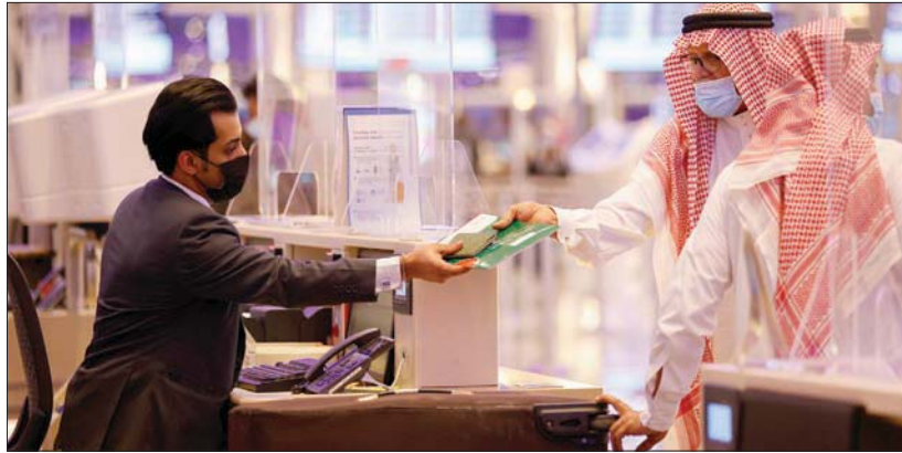
مطار الملك عبد العزيز الدولي بجدة

تلقى جرعات اللقاح المعتمدة في المملكة، و10 أيام من تاريخ أخذ العينة الإيجابية لمن لم يستكمل تلقي جرعات اللقاح المعتمدة في السعودية. وأكدت الوزارة أن هذه الإجراءات ستدخل حيز التنفيذ، صباح الأربعاء المقبل، مشددة في الوقت نفسه على ضرورة التزام الجميع بالإجراءات الاحترازية والتدابير الوقائية والبروتوكولات الصحية المعتمدة، والمشاركة في استكمال أخذ جرعات اللقاح المعتمدة.