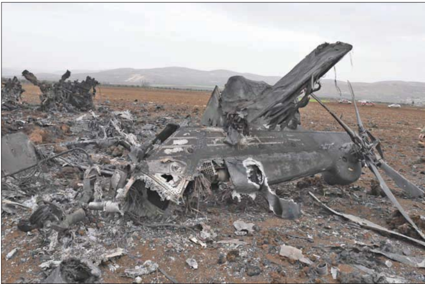
حطام مروحية أميركية قرب جنديرس في ريف حلب شمال سوريا أمس