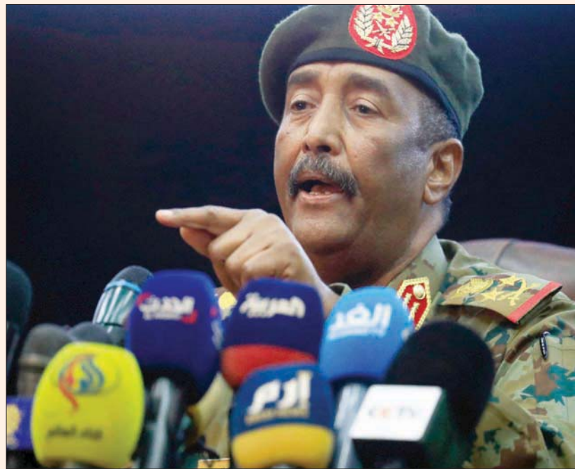
عبد الفتاح البرهان (أ.ب)

الخرطوم؛ محمد أمين ياسين أكد رئيس مجلس السيادة الانتقالي في السودان عبد الفتاح البرهان، في تصريحات مثيرة ألقاها في دارفور، أن الجيش لن يسلم السلطة إلا عبر الانتخابات أو التوافق السياسي، ما رأت فيه أوساط سياسية تعبيراً عن رغبة العصاة ولاية شمالي دارفور، في ظل مساع أممية لتجاوز أزمة تهدد بأخذ البلاد نحو الحرب الأهلية. فيما دعا «تجمع المهنيين» إلى وحدة «قوى الثورة» من أجل «إسقاط الانقلاب» متلماً فعلت بإسقاط نظام الرئيس عمر البشير في أبريل (نيسان) 2019.