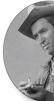
جيمس ستيفارت في «نيتستر 73»

في «قوة الكلب» لجين كامبيون وهو وسترن حديث (أي أن أحداثه تقع في القرن الماضي وليس ما قبله) والسقوط الصعب (The Harder They Fall) لجيمس سامويل بطولة سواد و«هنري العجوز» لبونسي بونسيرولي الذي شهد إعجاباً عندما تم عرضه في دورة مهرجان فينيسيا الأخيرة. «قوة الكلب» وسترن حديث، أي أن أحداثه تقع في القرن الماضي وليس قبله. وهو كالأفلام الحديثة التي تعتمد على الأناغرافيا لا سيما الأفلام التي تتحدث عن الغرب الأمريكي القديم. هناك أفلام جيدة ولو أنها لم تستطع استيعاب حجم إقبال كبير من بينها «الابن الأخير» (The Last Son) ساتون و«آخر مبارزة» (Shoot Out) مايكل فايفر و«المرأة التي سرقت العربية» (The Woman Who Robbed the Stagecoach) لتراتيز ميلز و«مجرم مفقود» (Outlaw) لداريل مايسون و«ذا بلزنت فالى وور» (The Pleasant Valley War) لتراتيز ميلز أيضاً.