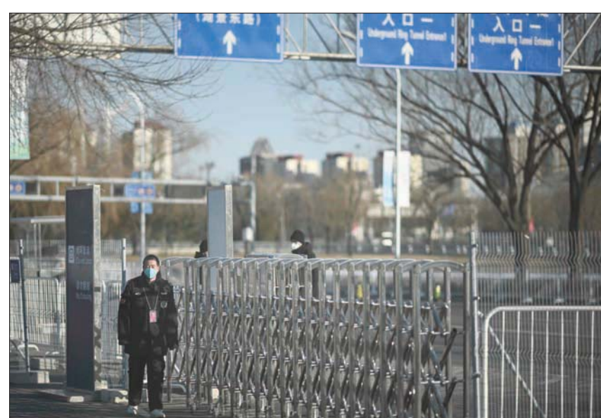
رجل أمن يتفقد المنطقة المغلقة الخاصة بالمشاركين في الأولياد الشتوية في بكين أمس

وحدثوا من أن العالم سيكون على موعد مع خطر كبير إذا حدث ذلك؛ لأن الفيروس يجمع بين صفات متلازمة الشرق الأوسط التنفسية (ميرس - كوف) من حيث القدرة على التسبب في عدد كبير من الالتهابات بين المصابين به (قدروا المعدل المحتمل بوفاة شخص بين كل ثلاثة أشخاص مصابين في المتوسط)، وصفات كورونا المستجد من حيث الانتشار السريع. وأشاروا إلى أنه لا يمكن تحديد عدوى هذا الفيروس بواسطة الأجسام المضادة التي تستهدف الفيروس المسبب لـ«كوفيد - 19».