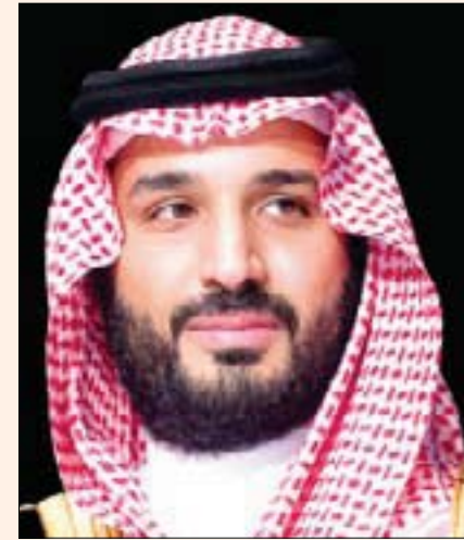
الرياض، الشرق الأوسط

المجالات، وفرص تطوير مجالات الشراكة الاستراتيجية بين البلدين الصديقين، وتأكيد تعزيز التعاون المشترك في إطار «الرؤية السعودية - اليابانية 2030». كما تبادل الجانبان، وجهات النظر حيال الكثير من القضايا الإقليمية والدولية والجهود المبذولة بشأنها.