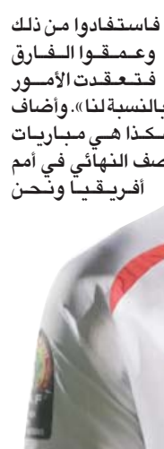
تراوريه وأحزان الهزيمة

فاستفادوا من ذلك وعمقوا الفارق فتعقدت الأمور بالنسبة لنا». وأضاف «هكذا هي مباريات نصف النهائي في أمم أفريقيا ونحن خسر أمام نيجيريا صفر - 1. وخاضت بوركينا فاسو دور الاربعة للمرة الرابعة بعد 1998 التي حجزت بطاقة دور الاربعة على حساب تونس (1 - صفر)، فعاد قلب دفاع نهضة بركان المغربي إيسوفو دايو ولاعب وسط إيسيرا الكرواتي حسن باندنيه ومهاجم أستون فيلا الإنجليزي