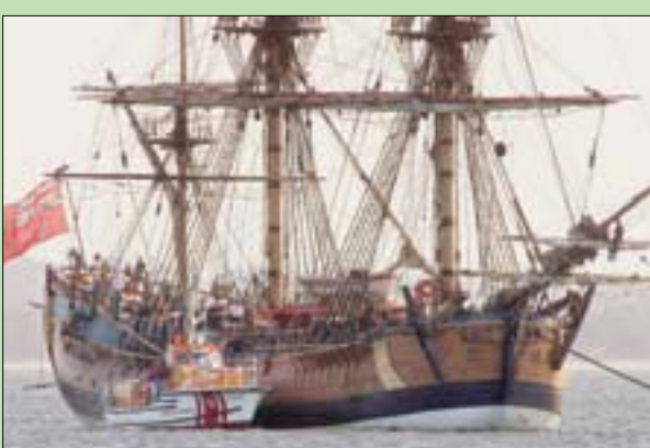
نسخة طبق الأصل من سفينة إنديفور في سيدني

وحدث ذلك قبل أشهر قليلة على وفاة كوك في هاواي في فبراير (شباط) عام 1779، وبعدما أصمت السفينة قرنين في قاع المرجأ، بقي نحو 15 في المائة منها فقط سليماً، وفق ما يوضح المتحف الأسترالي. وقال ساميشن إن «التركيز ينصب حالياً على ما يمكن فعله لحماية الحيا على والحفاظ عليه».