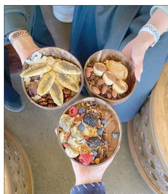
مقاهي «الجديدة» تتنافس على تقديم الأطباق بشكل فني مبتكر

ويستوقف زائر «الجديدة» مطعم بتصميم ريفي غريب، وكراسي من الخوص بلا مساند للظهر، إنه «مون شيل» الذي يأتي بإدارة وطهي فتيات سعوديات من سكان العلاء، يقدمن المأكولات في أطباق عضوية مصنوعة من غلاف جوز الهند، وتأتي غنية بالألوان والمكونات الصحية التي تتحول معها وجبة الطعام إلى مهرجان من النكهات الاستثنائية. يوضح عاملات المطعم لـ«التشرق الأوسط» أن