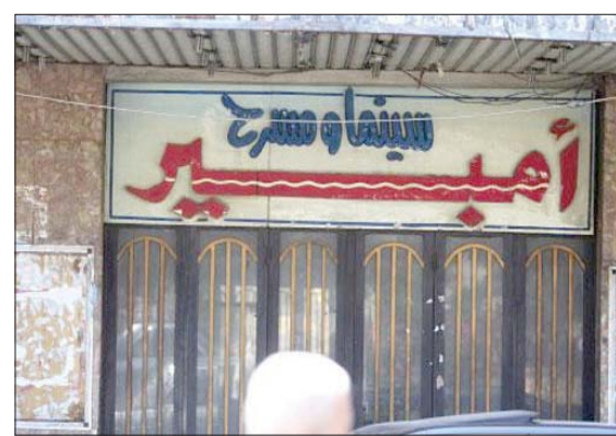
سينما أمبير طرابلس

ومن المنتظر أن تشهد سينما «أمبير» فور تجهيزها معارض ورسم وأخرى للمصنقات قديمة ترتبط بأفلام سبق وعرض فيها. كما تهيء لمعرض يحمل اسم الممثل الطرابلسي المخضرم نزار