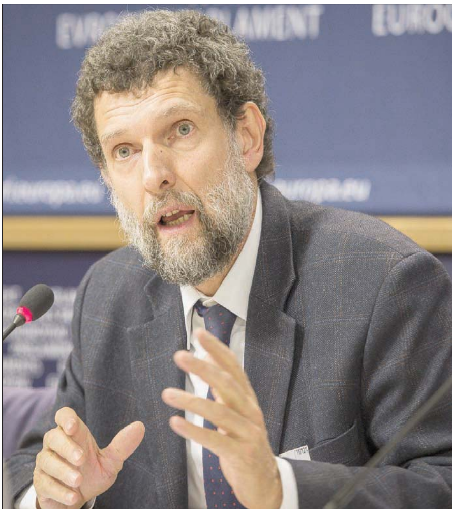
رجل الأعمال التركي الناشط البارز في مجال الحقوق المدنية عثمان كافالا

ويقيم كافالا (64 عاماً) في السجن منذ عام 2017، ولم يُدعى في أي جريمة، واتهم أولاً بتمويل حركة الاحتجاجات المناهضة للحكومة في 2013، فيما عرف بأبحاث «جيزي بارك»، وبرات المحكمة ساحتها وآخرين في فبراير (شباط) من العام الماضي، لكن سرعان ما ألقي القبض عليه بعد ساعات قليلة مع تغيير الاتهامات