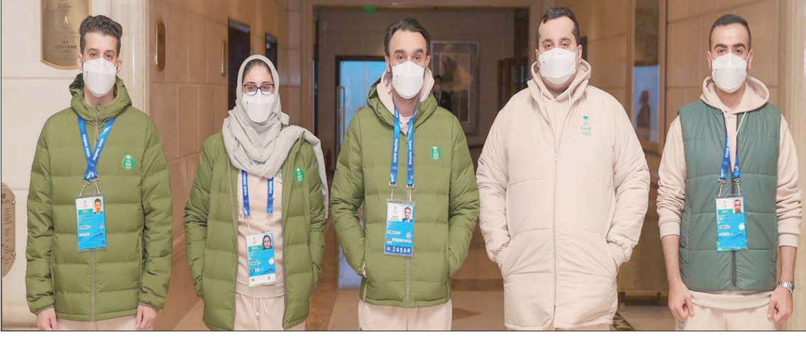
الأمير عبد العزيز الفيصل يتوسط الوفد السعودي لدى وصوله إلى بكين

في الاستمرار بالعمل الجاد لتطوير رياضتنا في مختلف الألعاب، تحقيقاً لمستهدفات رؤية المملكة 2030، الرامية إلى تحويل أحلام كل الرياضيين إلى واقع ونفخر به جميعاً». ويضم الوفد السعودي كلاً من الأمير فهد بن جلوي بن عبد العزيز نائب رئيس اللجنة الأولمبية والبارالمبية، والأميرة ريم بنت بندر بن سلطان عضو مجلس إدارة اللجنة الأولمبية والبارالمبية السعودية وعضو اللجنة الأولمبية الدولية، وأعضاء الفريق عضو مجلس إدارة اللجنة الأولمبية والبارالمبية.