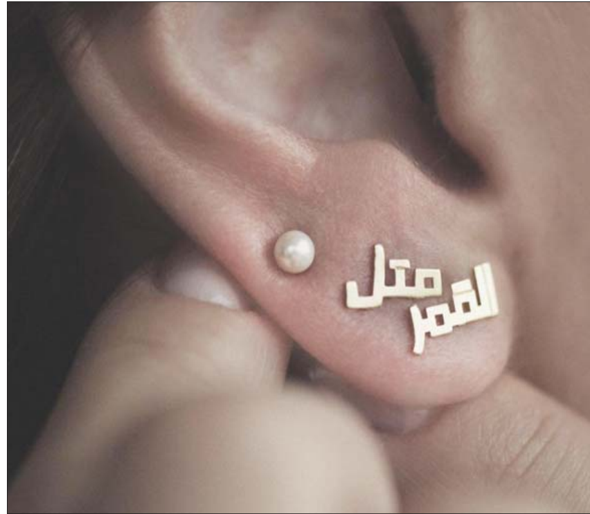
أقراط آذن من تصميم جيري غزال

يقول حلاوي لـ«الشرق الأوسط»: «الفكرة راودتني خلال الحجر المنزلي فوجدت مساحة أتسلى فيها من ناحية، وتعود علي ببعض الريح المادي من ناحية ثانية، وتعامل مع شركة خاصة (Redbubble)، تهتم بتفصيلها والترويج لها عبر وسائل التواصل الاجتماعي». جميع الأفكار التي يقدمها حلاوي في مجموعته هي من تصميمه، ويتوجه بها إلى جميع الأعمار. وتصل الراجب بشرائها (اونلاين) عبر خدمة التوصيل إلى المنزل (دليفري).