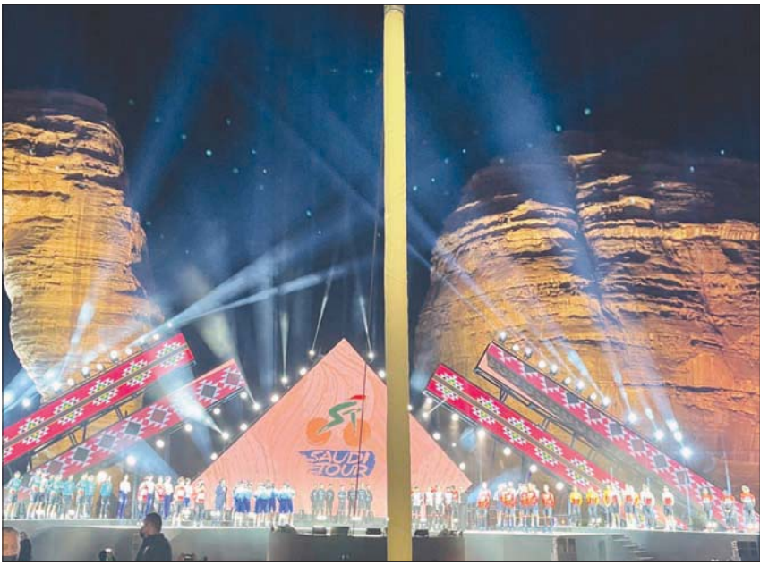
جانب من حفل طواف السعودية الذي دشّن أمس في مهد الحضارات «العُلا»

الجدير بالذكر أن السباق سيصاحبه عدد من الفعاليات والسينات الرياضية، في مقدمتها سباق الجمهور، وسباق السباق النسائي، وسباق الناشئين الذي يتخلقه الاتحاد السعودي للدرجات، إلى جانب سباق مخصص للأطفال.