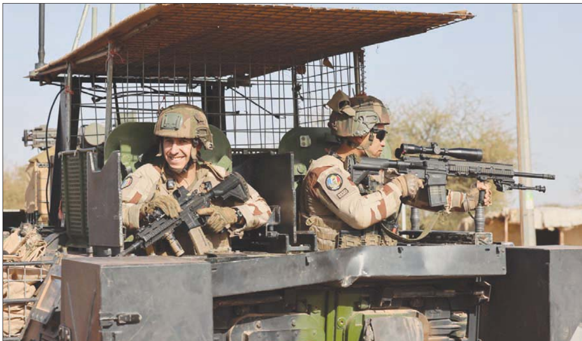
جنود فرنسيون من قوة «برخان» يقومون بدورية في تمبكتو شمال مالي ديسمبر الماضي

في البيان يلجأ إلى تصريحات وزير الخارجية جان إيف لو دريان الذي وصف الحكم الحالي في مالي بأنه «غير شرعي» وإلى تصريحات وزيرة الدفاع فلورانس بارلي التي اعتبرت أن الإجراءات التي تقوم بها المجلس العسكري، ومن ضمنها طلب رحيل القوة الدنماركية «استفزازية». وما سبق غيض من فيض ما جاء على السنة المسؤولين الفرنسيين الذين لم «يهضموا» حصول انقلابين عسكريين «من وراء ظهر باريس» وتقارب المجلس العسكري الانتقالي مع مجموعة (فاغنر) الروسية والإخلاق بوع إجراء انتخابات عامة لغرض إعادة السلطة إلى المدنيين». وفي حين تنهت باريس «فاغنر» بأنها تحضر «الذهب» خيرات مالي على غرار ما تقوم به في بلدان أفريقية أخرى، رد رئيس الوزراء المالي على ذلك بتأكيد أن باريس تعارض المجلس العسكري لأنه «يمس بمصالحها» وأن تركيزها على إجراء انتخابات بهدف إلى إعادة أصدقائها إلى السلطة. وكان وزير خارجية مالي عبد الله ديوب نوبه يوم الجمعة الماضي في باماكو «لا تستبعد شيئاً» في علاقاتها بفرنسا ما يدل على أن المجلس العسكري ماضٍ في عملية النزاع مع باريس، وأن