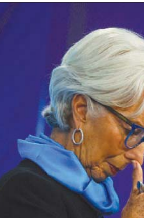
تشن وسائل إعلام هجوماً على البنك المركزي الأوروبي ورئيسه كريستين لاغارد الملقبة بـ«سيدة التضخم»

الأماني الجديد «نورد ستريم 2» في حال نشوب نزاع مسلح. في الوقت نفسه، يتصاعد استياء الموظفين في كل البلدان الأوروبية في مواجهة تراجع القوة الشرائية، وهو موضوع وصل إلى قلب الحملة الرئاسية الفرنسية. ولغفت إدغار ووك، الاقتصادي في مجموعة «ميتزتلير آسيت لاغارد الملقبة «دمام إنفليشن» أو