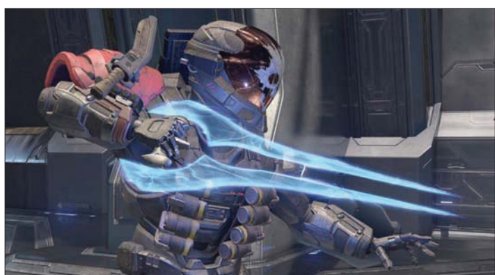
معارك ضارية في صراع عبر المجرات

وتقدم اللعبة نمط اللعب الفردي، إلى جانب الجماعي الذي سيمتعه بسبل عدة للعب، تشمل Capture the Flag وDeathmatch، والقدرة على التنافس بين فريقين، كل منهما مكون من 4 لاعبين، والتنافس بصحبة 24 لاعباً. ويمكن استخدام قدرات تعزز من مهارات اللاعب لفترة محدودة في نمط اللعب الجماعي، مثل سرعة التنقل والتخفي ورد الطلقات عن اللاعب نحو العدو، وغيرها. وتقدم اللعبة كذلك مجموعة من مراحل التدريب للاعبين الجدد وتجربة الأسلحة المختلفة ضد الأعداء.