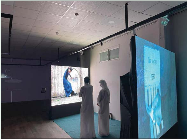
جانب من ملتقى الفيديو آرت بنسخته الماضية