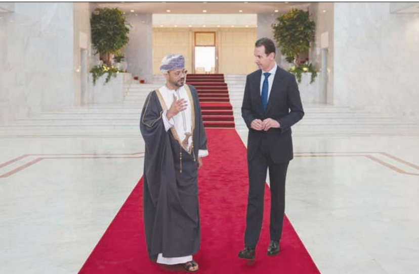
الأسد لدى استقباله وزير خارجية عمان في دمشق أمس

وكان سلطان عمان بين الزعماء المهتمين لرئيس الأسد بفوزه بالانتخابات الرئاسية