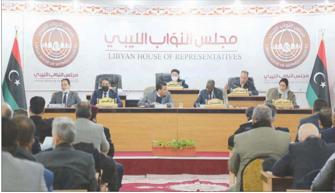
صورة وزعها مجلس النواب الليبي لجانب من اجتماعه أمس في طبرق

أظهر مجلس النواب الليبي، أمس، تصميماً وتمسكاً كبيرين بالمضي في مسار اختيار رئيس جديد للوزراء، معتبراً أن الحكومة الحالية التي يرأسها عبد الحميد الدبيبة «انتهت مهمتها بعد تأجيل إجراء الانتخابات»، وذلك رغم تشديد أميركي وأممي على عدم الحاجة لتغيير «حكومة الوحدة الوطنية».