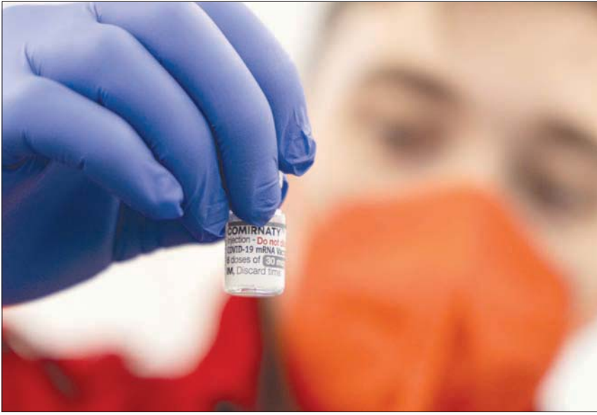
مركز تطعيم في النمسا عشية جعل اللقاح إلزامياً

وبينما أطلق بعض الخبراء على متغير «أوميكرون» الفرعي اسم «أوميكرون الخفي»، لصعوبة التمييز بينه وبين المتغير الأصلي في اختبارات الـ«بي سي آر»، وصف عالم بجامعة «روتستتر» الأميركية هذه التسمية بأنها مضللة، متفقاً مع ما ذهب إليه آخرون