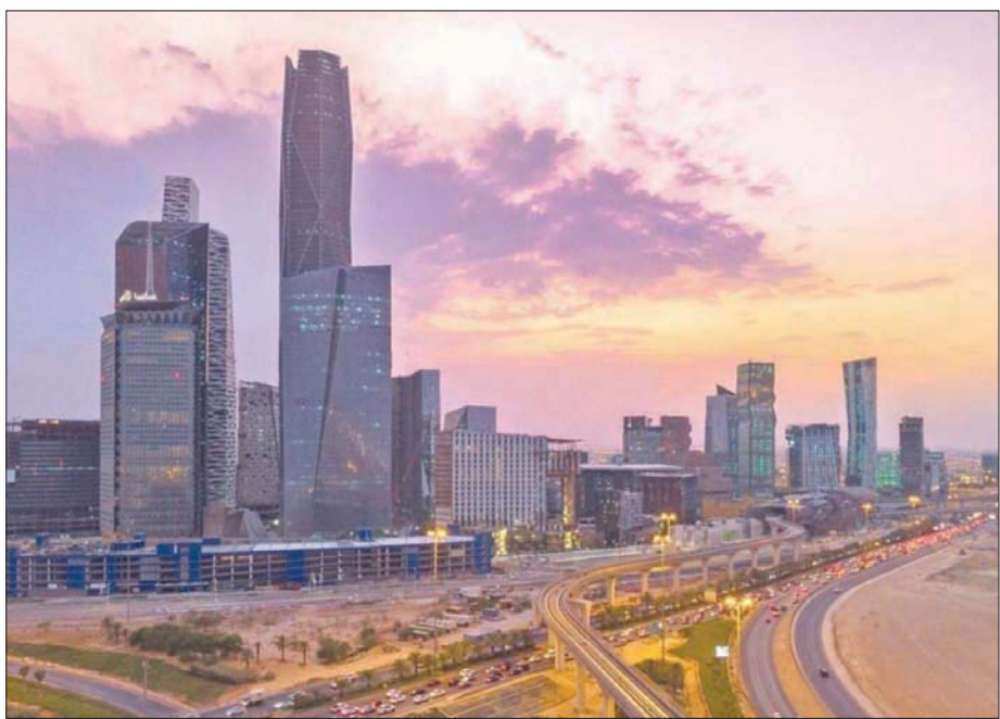
تسعى السعودية من خلال تنظيم مؤتمر «ليب» لتعزيز دورها في الإقليم والعالم كمرکز رقمي (واس)

بما نسبتها 92 في المائة، على أن أزمة الجائحة قد سرعت خطى مؤسسات البلاد نحو التحول الرقمي على مدار العام الماضي. وفيما يتعلق بأبرز المجالات التي تحظى بالأولوية في الاستثمار الرقمي للمؤسسات الحكومية السعودية في عام 2022 وما بعده، قال 67 في المائة من المشاركين في الاستطلاع إنهم يعزّون الإنفاق على إدارة رأس المال البشري، و61 في المائة يعزّون الاستثمار في تخطيط الموارد المؤسسية، فيما ذكر 56 في المائة الحلول الأساسية، و41 في المائة تجربة العملاء. وحسب «إس إيه بي» تحلل