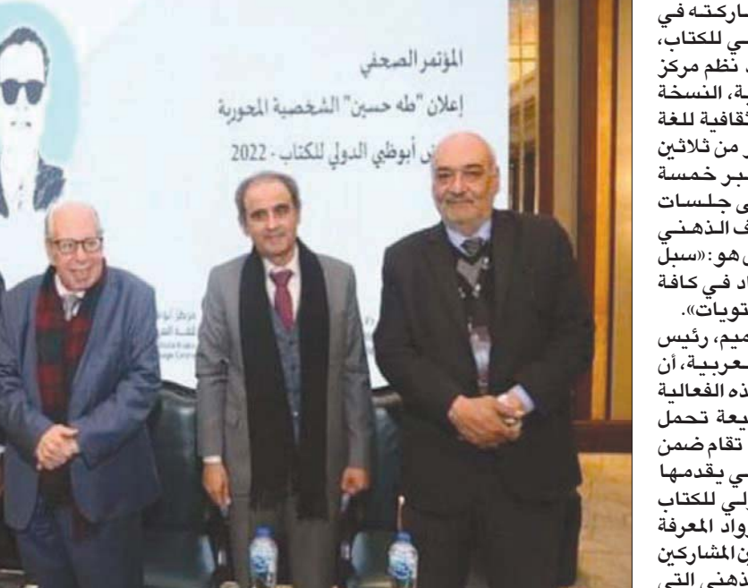
جانب من الفعالية

على هامش مشاركتها في معرض القاهرة الدولي للكتاب، وعلى مدار يوم واحد نظم مركز أبوظبي للغة العربية، النسخة الثانية من «خولة اللغة العربية» بمشاركة أكثر من ثلاثين باحثاً وأكاديمياً، عبر خمسة محاور موزعة على جلسات متنوعة من العصف الذهني بتتبع عنوان عرض هو: «سبل النهوض بلغة الضاد في كافة المجالات وعلى كل المستويات». وذكر د. علي بن تميم، رئيس مركز أبوظبي للغة العربية، أن النسخة الثانية من هذه الفعالية الثقافية المعرفية الرفيعة تحمل أهمية كبرى نظراً لأنها تقام ضمن الأجواء الثقافية التي يقدمها معرض القاهرة الدولي للكتاب بشكل عام، بمشاركة رواد المعرفة المصريين والمتخصصين المشاركين في جلسات العصف الذهني التي تضمنتها الخولة.