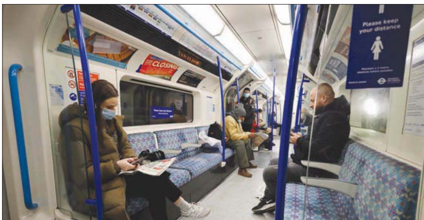
في وقت بدأ فيه مستخدمو وسائل النقل العام العودة إليها في العاصمة البريطانية... تتقاذف الحكومة ورتاسة بلدية لندن المسؤولية لإيجاد تمويل مستدام