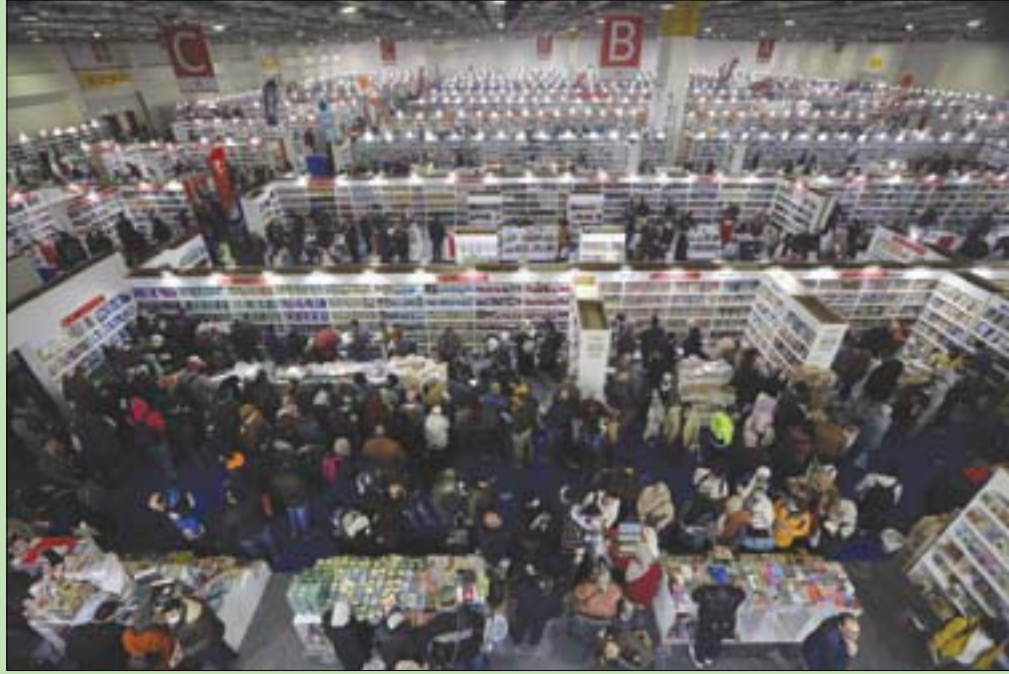
القاهرة، رشا أحمد