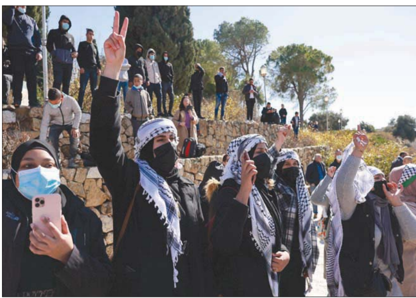
إسرائيليون عرب أمام مقر الحكومة في القدس احتجاجاً على سياساتها حيال قرى النقب (أ.ب.)

على أراضيهم. حدث ذلك بزنج من التهديدات، والعنف، والرشوة والاحتلال». وأضاف أن الدراسة تبين كيفية سير العملية العسكرية، أيضاً من خلال قصصات ورق تبادله ضباط الحكم العسكري فيما بينهم، وأن الضباط الكبار كانوا يعلمون أن هذه عملية عسكرية غير قانونية، ولذلك، كانت هناك أهمية لتسليم البدو أوامر إسرائيليين عرب أمام مقر الحكومة في القدس احتجاجاً على سياساتها حيال قرى النقب (أ.ب.) بموجبها انتقل البدو (طوعية)». وأشار إلغازي إلى حقائق أخرى، بينها «معارضة البدو واحتجاجاتهم، وإصرارهم على محاولة التمسك بأراضيهم، إلى جانب تهديدات وعنف الجيش». وأضاف أنه «بالإمكان أن نرى كيف تم منع النشر وتنظيف التقارير، مرحلة بعد أخرى، إلى حين المصادقة على الصيغة التي