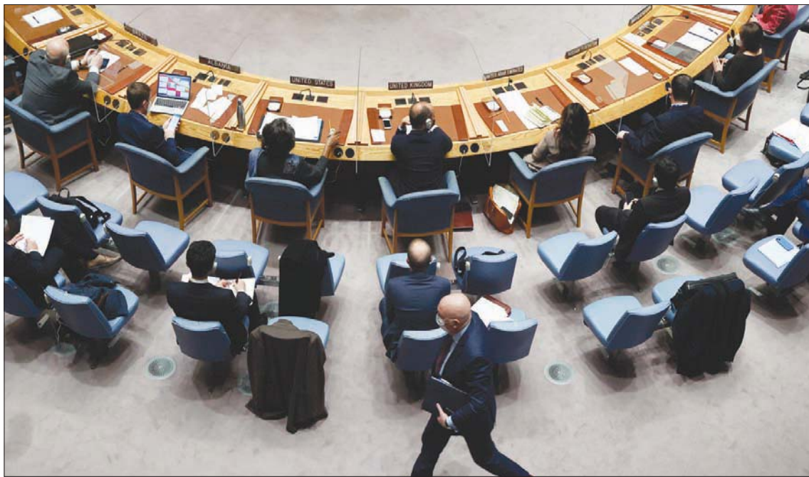
السفير الروسي يغادر جلسة مجلس الأمن قبل كلمة نظيره الأوكراني أمس (إبأ)

معبرة عن «دهشتها وخيبة أملها». ورفضت اتهام نيبينزيا بأن واشنطن كانت تحاول «دبلوماسية مكبر الصوت» من خلال الدعوة إلى اجتماع مجلس الأمن في شأن الأزمة. وقالت: «خليلوا مدى شعوركم بعدم الارتياح إذا كان هناك مائة ألف جندي على حدودكم»، موضحة أنه «لا توجد خطط لإضعاف روسيا، كما يدعي زملأؤنا الروس». وقالت: «نرحب بروسيا كعضو مسؤول في المجتمع الدولي لكن أفعالها على حدود أوكرانيا غير مسؤولة»، مضيفة أن «الدبلوماسية المشجعة ليست استفزازات».