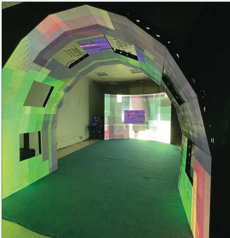
الفيديو آرت... تكنولوجيا الصورة والفيديو تكاملت مع الكاميرا والتلفزيون والسينما

وبالإضافة لأعمال الفيديو آرت، تشمل دورة هذا العام أوراقاً بحثية ستكون مراجع مطبوعة ذات قيمة بحثية فنية وعلمية، خاصة أنّ المملكة