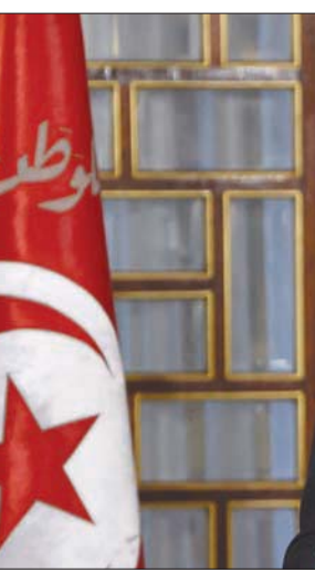
الرئيس قيس سعيد

منع الرئيس من مواصلة السير في هذا الخيار». وبخصوص الرزنامة الانتخابية، أوضح البرينصي أن الهيئة «في الطرف الوحيد المخول له تحديد الرزنامة الانتخابية، التي عن مثل هذه المواعيد يستوجب تحضيرات مسبقة، هدفها تهيئة المناخ الانتخابي، إضافة إلى توفير