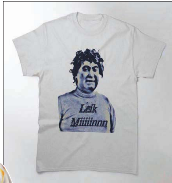
الممثل نعيم حلاوي يدخل هذا المجال بشخصية «أبو عبدو»

وما تحدثت عنه آلين وطفا حدث مع كثيرين وبينهم نانسي عجرم، التي اختارتها شركة «هواوي» للأجهزة الخلوية سفيرة لعلامتها