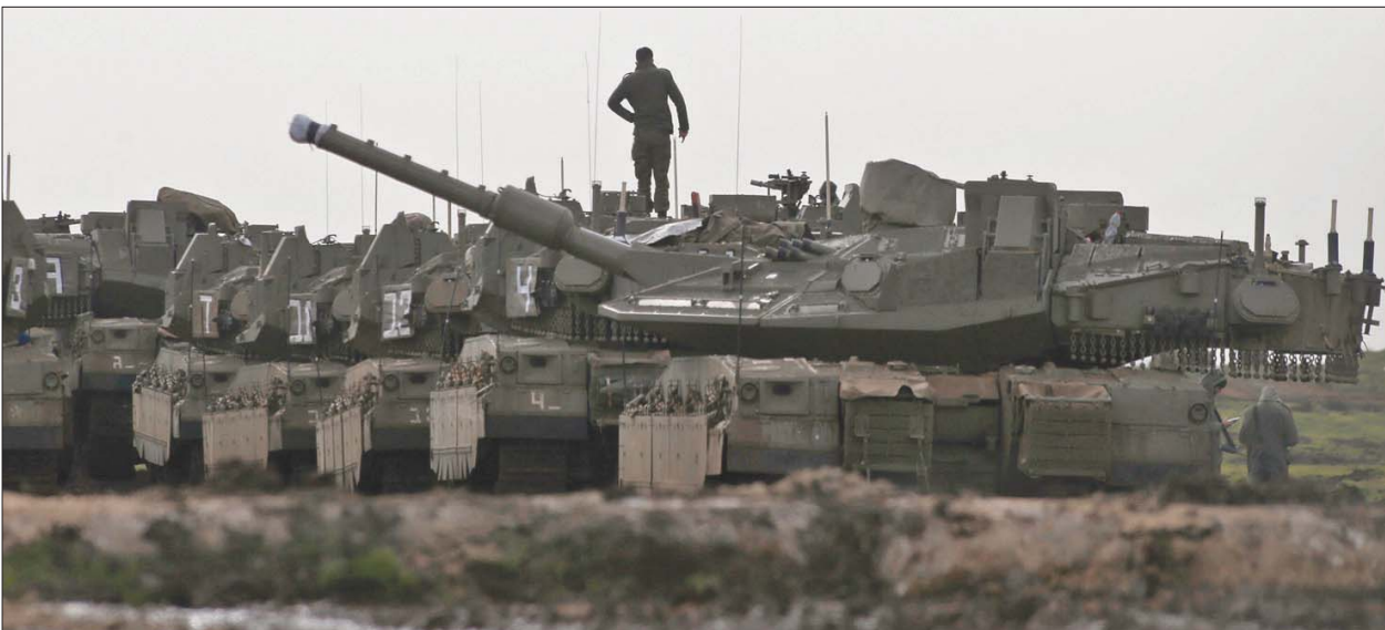
جندي إسرائيلي فوق إحدى دبابات «ميركافا» في الجولان السوري المحتل أمس

وأشار «المرصد»، وفقاً للمصادر، إلى أن «روسيا تهدف إلى إخراج إيران وأتباعها من المرفأ، وتعمل على السيطرة على ميناء اللاذقية، لتجنيبه الغارات الجوية الإسرائيلية المتكررة، وذلك بعد سيطرتها قبل نحو عامين تقريباً، على ميناء طرطوس، وبيعد 19 كيلومتراً عن قاعدة حميميم الروسية الواقعة جنوب