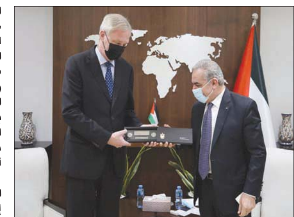
استقبل أشّية أمس رئيس مكتب تمثيل جمهورية التشيك بيتر ستاري لمناسبة انتهاء مهامه الرسمية

حول كل شيء، منظمة التحرير والحكومة وإعادة إعمار قطاع غزة. لكن وزير الخارجية الجزائري