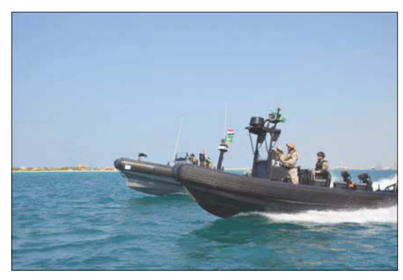
جانب من تدريبات «مرجان 17» البحرية السعودية - المصرية (المحدث العسكري المصري)

بجانب تدريب بدارت «مرجان 17» البحرية السعودية - المصرية (المحدث العسكري المصري) وعلى صعيد آخر، انطلقت فعاليات التدريب الجوي المشترك المصري - السعودي، والتي أظهرت ما يتمتع به الجانبان من كفاءة قتالية عالية». وحضر المرحلة الرئيسية للتدريب عدد من قادة القوات المسلحة المصرية والسعودية.