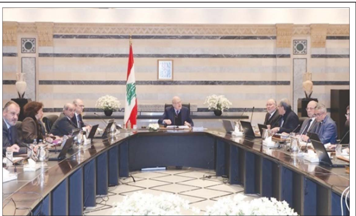
مقاياتي لدى ترؤسه اجتماع مجلس الوزراء (الوكالة الوطنية)