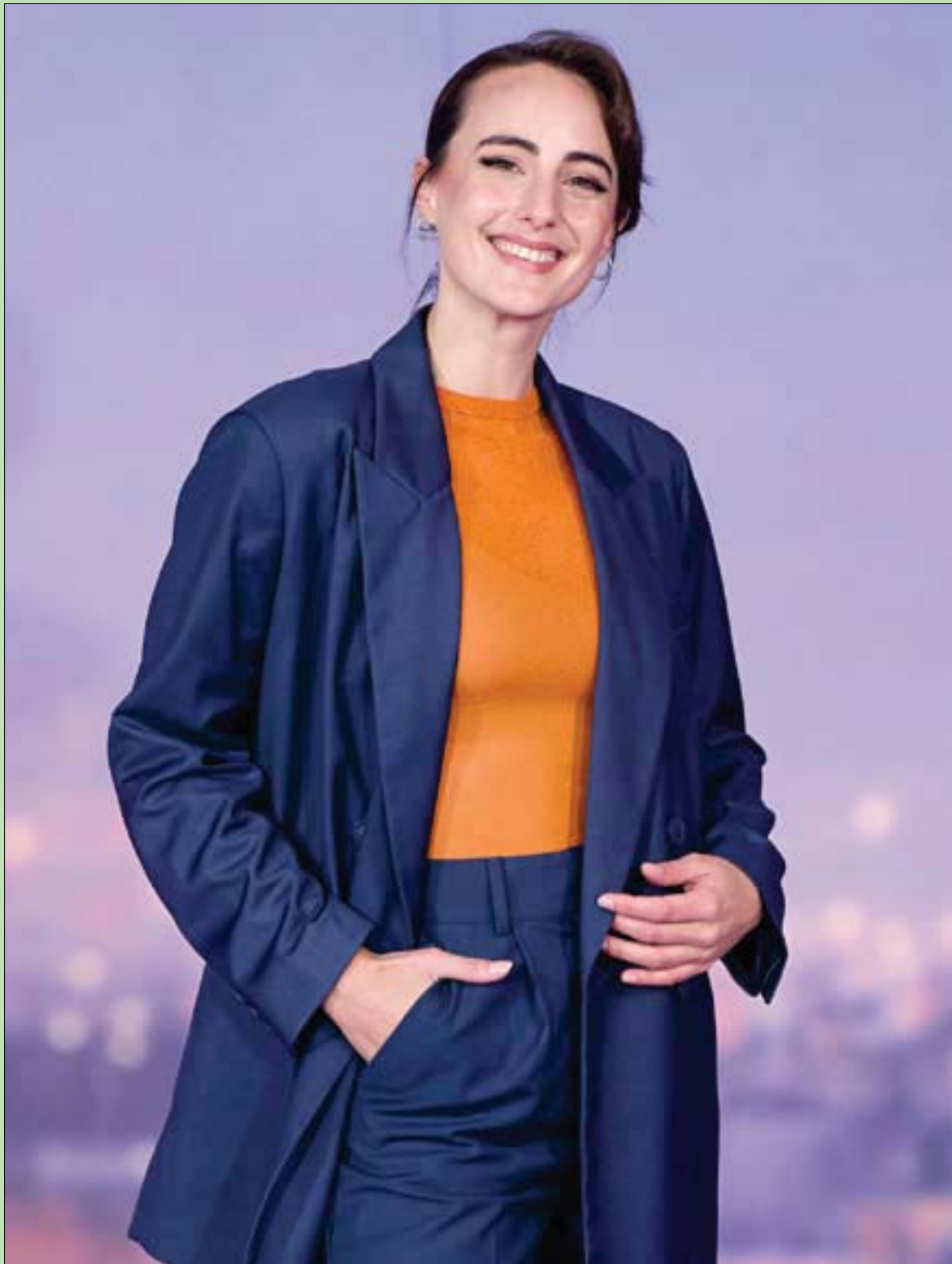
الممثلة الفنزويلية إميليا لازو تقف أمام المصورين لدى حضورها فيلم «من خلال نافذتك» في مدريد