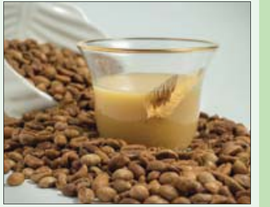
قهوة سعودية