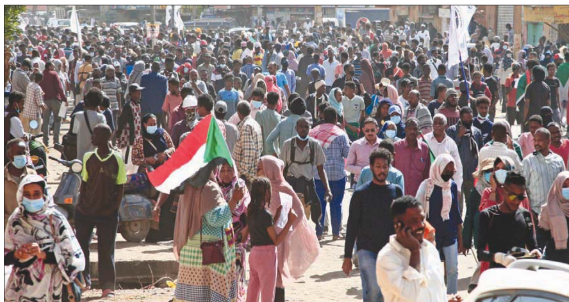
السودان يواجه احتجاجات مستمرة منذ تولي الجيش السلطة في 25 أكتوبر الماضي

مندبيز يدعم غودفري، مشيراً إلى أن عملية المصادقة من قبل مجلس الشيوخ ستكون طويلة، وحثاً على التدقيق بخلفيات المرشح ومؤهلاته. وينتقد البعض تأخر الإدارة الأميركية في تعيين سفير. وقال السيناتور الجمهوري جيم ريش، في تصريحات خاصة لـ «الشرق الأوسط»، إن «المحاولة تدل بشكل واضح على غياب الأوليات التي أعطيت لترشيح اسم لهذا المنصب منذ أن أعلن وزير الخارجية السابق مايك بومبيو، عن تبادل السفراء مع السودان في ديسمبر (كانون الأول) 2019»، مشيراً إلى «أن شغل هذا المنصب أمر طارئ». كما لمح ريش إلى أن مرشح الإدارة جون غودفري، ليست لديه خبرة سابقة كسفير، قائلاً: «كنت أفضل أن أرى مرشحاً لديه خبرة سابقة كسفير، لكنني أعلم أن وزارة الخارجية تواجه تحديات في التعيينات لهذا المنصب، كما قالت لنا».