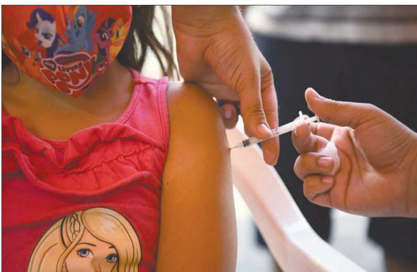
تطعيم امرأة في مركز تطعيم بسان لورينزو جنوب غربي باراغواي

أحد مقاطع الفيديو، الذي تم نشره عام 2020 واستمر تداوله عبر الإنترنت حتى عام 2021 أن «97 في المائة من متلقي لقاح كورونا سيصابون بالعقم»، نقلًا عن «تسريبات من كبريات شركات الصيدلة». لكن حتى الآن