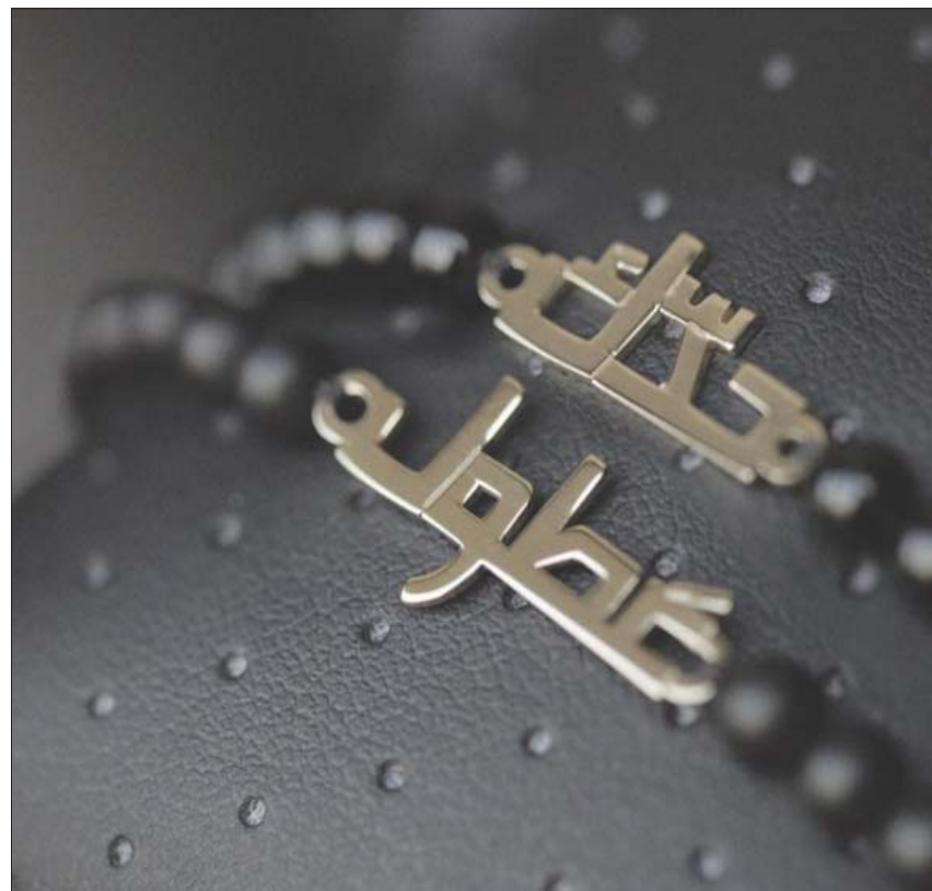
يارا أطلقت تصاميمها للمجوهرات بعنوان «بتحب ما بتحب»

ومعنوياً. فيكونون بمثابة راع تجاري لهم».