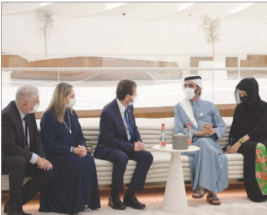
الشيخ محمد بن راشد آل مكتوم نائب رئيس الدولة حاكم دبي لدى لقائه الرئيس الإسرائيلي أمس

لشعوبنا ومنطقتنا والعالم بأسره». من جهته قال الشيخ نهيان بن مبارك آل نهيان، وزير التسامح والتعايش في الإمارات المفوض العام لمعرض إكسبو 2020 دبي: «لدى إسرائيل الكثير لتقدمه على منصتنا العالمية، ولذلك يسعدنا أن تكون معنا في هذه المشاركة معنا، في إكسبو 2020 دبي. نحن فخورون باستضافة أول إكسبو عالمي يقام في منطقة الشرق الأوسط وأفريقيا وجنوب آسيا ويترحيها الإماراتي الحار بالعالم بأسره. وتعد مشاركة 192 دولة بمثابة شهادة على جهود دولة الإمارات في توحيد العالم في منصة واحدة موحدة في محاولة لبناء الجسور والاندماج في حوار بناء وتطوير حلول مستدامة لتحديات العصر الحديث. نعتقد اعتقاداً راسخاً أن ما يوحد البشرية يفوق بكثير ما يفرق بينها». الإمارات وقادتها بجراً على اتفاقيات إبراهيم التاريخية». وأضاف: «كان هذا قراراً ليس فقط لتطبيع العلاقات، ولكن لتشكيل غد جديد للجبل القادم لكل من دولتنا والمنطقة بأسرها. إنه وقت قصير منذ الإعلان عن الاتفاقات، وقد تجاوزت تجارتنا بالفعل مليار دولار، وتم توقيع أكثر من 120 اتفاقية، وتم إنشاء صندوق ثنائي للبحث والتطوير مؤخرًا بقيمة 100 مليون دولار. الإسرائيليون والإماراتيون يدرسون معاً وتعلمون تقافات ولغات بعضهم البعض. لقد زار 250 ألف إسرائيلي الإمارات بالفعل، ومنتظر العديد من الإماراتيين الذين يسافرون إلى إسرائيل بعد كوفيد». وتابع: «إن دولة إسرائيل حريصة على السير مع دولة الإمارات وجميع الدول الموجودة هنا في المعرض نحو غد أكثر إشراقاً واستدامة وسلاماً،