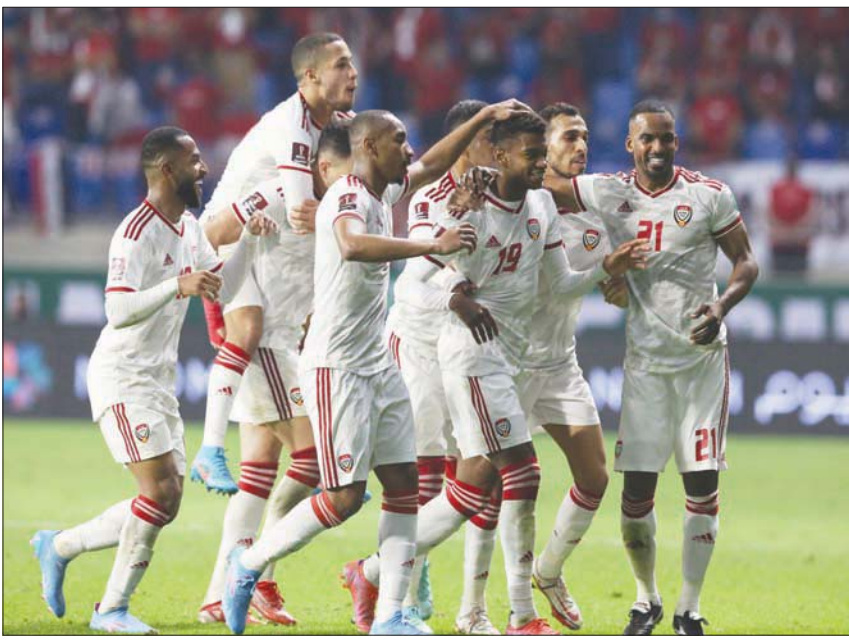
هل تستمر أفراح «البيض» الإماراتي أمام المنتخب الإيراني؟

في المقابل، فقتت سوريا التي لم تفرز حتى الآن في الدور الثالث على غرار العراق وفيتنام، وهي التي حققت 7 انتصارات متتالية في المراحل الثماني للدور الثاني، أمالها في التأهل المباشر، وتجد نفسها ومدريها الروماني فاليريو