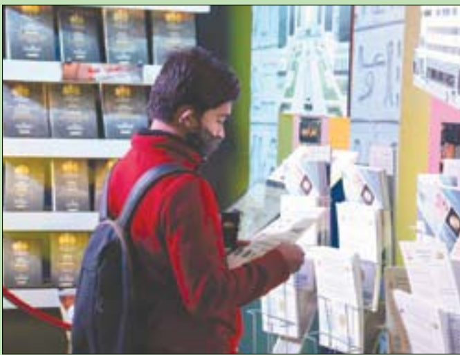
جانب من معرض القاهرة للكتاب

هنا دار النشر يتم اختزالها في مجرد «تطبيق»