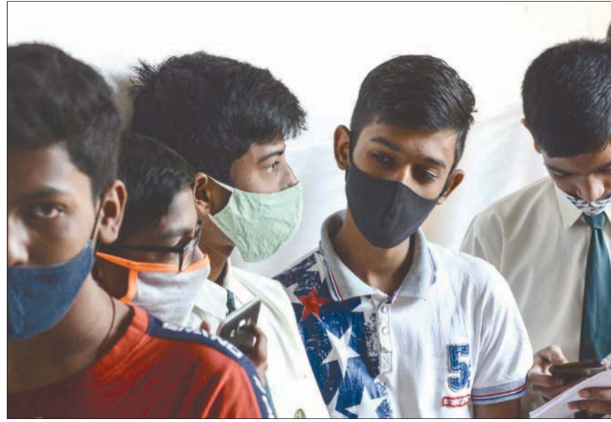
أطفال يصلفون لتلقي اللقاح في مومباي بالهند أمس

لكن الدراسة أكدت أن اللقاحات لا تزال تلعب دوراً مهماً في حماية الأفراد، وتقليل انتقال العدوى، خصوصاً بين الأشخاص الذين تلقوا الجرعات المعززة. يشار إلى أن «أوميكرون»