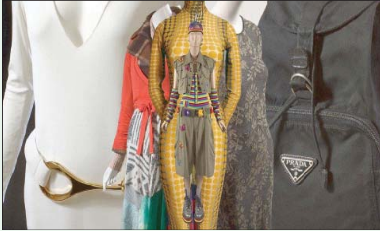
من القطع في معرض جديد مقام في متحف معهد الموضة للتكنولوجيا في نيويورك تحت اسم «إعادة الاختراع والتأمل: الموضة في التسعينات»

لنهلنا مع جميعنا أجزاء طلات من السلع المستعملة خاصة في الوقت، الذي تمتلأ فيه تلك المواقع بالقطع القديمة التي تعود إلى تلك الحقبة.