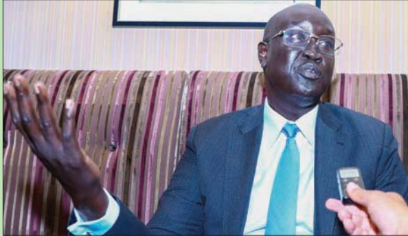
وزير الخارجية في جنوب السودان ميك أبي دينق

وقال دينق: «لولا الدور الإنبويي لما قام لدولة جنوب السودان بقيادة... إن الرئيس هيبال سياسي هو من أتى باتفاقية 1972، حيث منحت الحكم الذاتي لجنوب السودان، وعندما جاء الرئيس منغسو، قام بتدريب 80 ألفاً من جنوب السودان، وعندما جاء رئيس الوزراء ميليس زيناوي، ورغم أنه كان يبدى مساعده لحكومة الخرطوم وقتها، فإنه أقر بأن الجنوبيين حقاً في تقرير مصيرهم».