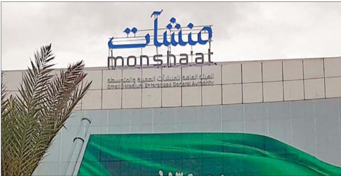
السعودية تضم حالياً نحو 30 من شركات رأس المال الجريء

(كانون أول) 2020 إلى 35 يوماً فقط في نهاية العام المنصرم، أي ما يمثل انخفاضاً 757 في المائة. ووفقاً للتقرير فقد ساعدت الإصلاحات الاقتصادية الواسعة التي تطبيقها الحكومة في إطار رؤية 2030 على زيادة الإقبال على أنشطة رأس المال الجريء التي تعتمد على تقديم التمويل مقابل حصة من الأسهم. لتصبح السعودية إحدى الأسواق الإقليمية الرائدة في هذا المجال. واتخذت البلاد العديد من الإجراءات الفعالة لدعم زيادة الأعمال وجذب الاستثمارات الأجنبية وتحسين بيئة الأعمال، وهو ما جعل السوق جاذبة لهذا النوع من الأنشطة. وبين التقرير، أن السعودية تضم حالياً نحو 30 شركة من شركات رأس المال الجريء، 14 استعدت للشركات الناشئة و18 جهة استثمارية لتمويل المشروعات الناشئة - ما بين مستثمرين ملاكيين وحاضرات أعمال أكاديمية - في الوقت الذي