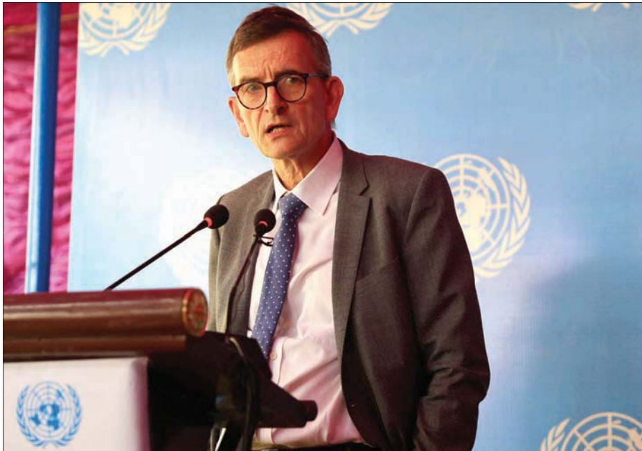
فولكر بيرتس رئيس بعثة «يونيتامس» الأممية في السودان

ويشدد تحالف «الحرية والتغيير»، الذي يضم عدداً كبيراً من الأحزاب السياسية وتنظيمات المجتمع المدني، على ضرورة تحديد سقف زمني لمعمل العملية السياسية التي تقودها الأمم المتحدة وفقاً لإجراءات واضحة «لا تسمح بتبطلها وإفراغها من محتواها». وأبدى التحالف مخاوفه من استغلال قادة الجيش للعملية السياسية الأممية كي يعززوا أركان سلطتهم في البلاد، ثم يشرفوا على انتخابات «صورية» تحفظ لهم السلطة الحقيقية في أيديهم حتى بعد انتهاء المرحلة الانتقالية.