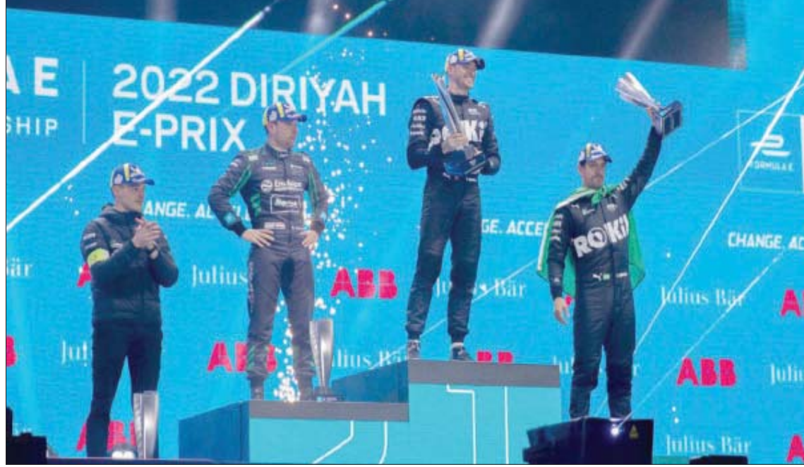
أصحاب المراكز الثلاثة الأولى خلال التتويج

وانضم ثلاثة متسابقين جدد إلى قائمة المتنافسين هذا العام من سباق فورمولا إي، وهم الإيطالي أنطونيو جيوفنازي (دراغون بينسك أوتوسبورت - الولايات المتحدة الأمريكية)، والبريطاني دان تيكنتوم (نيو 333 - الصين)، والأمريكي أوليفر إسكيو (أفالانش أندريتي - الولايات المتحدة الأمريكية). وستنتقل إلى العاصمة