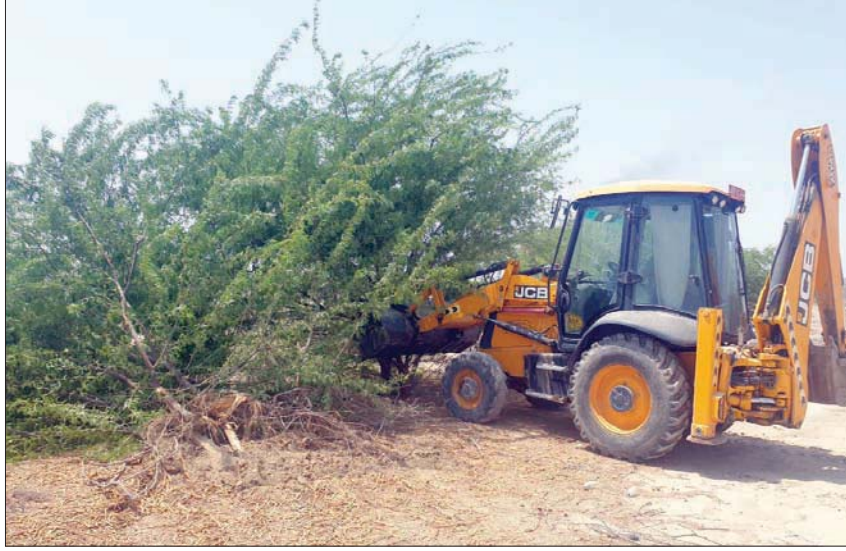
قلع المسكيت بالجرافة (بلدية صحار)

* تخصصي أول دراسات حياة برة بلدية صحار سلطنة عمان