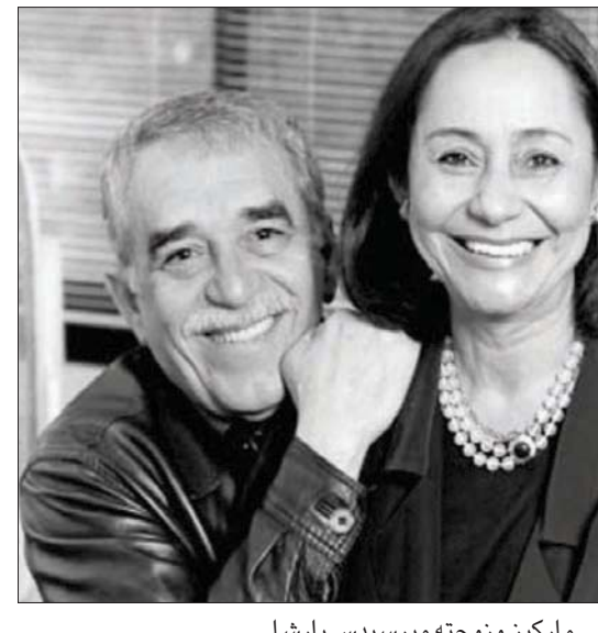
ماركيز وزوجته ميرسيدس بارشا

● اعتقد أن الكتاب يستلهم هاجس الموت، يتكثرون القصص، يحاولون ترتيب فصول الحياة وتفصيلها وإعطاء معنى