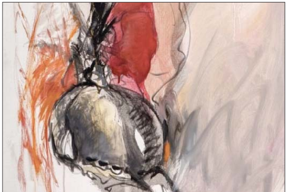
إحدى لوحات معرض البرقع