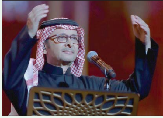
عبد المجيد عبد الله في حفل العودة

كلهم» و«يا طيب القلب وينك» أغان خالدة من روائع التسعينات، يشترك عبد المجيد غناها وبإلحاح من الجمهور، يتفان حجم المسافة الطويلة التي قطعها من النجومية، والعلاقة الثمينة التي ربطته مع جمهوره يحفظ ويحتفظ بفراغ أغانيه كجواهر لا تفقد بريقها.