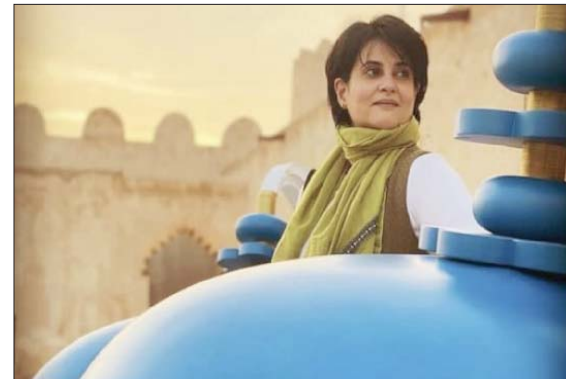
هلا آل خليفة مع البراقع الخشبية