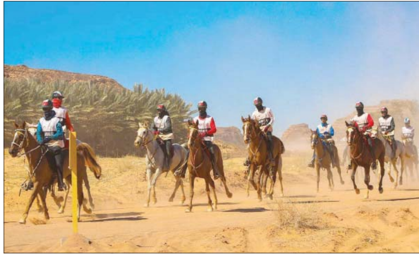
فرسان وفارسات تنافسوا على جوائز البطولة

ومع ختام منافسات بطولة كأس خادم الحرمين الشريفين للقدره والتحمل 2022، تستعد محافظة الغلا يوم 11 فبراير (تسبأط)، وعلى مدار يومين، لاستضافة بطولة ريتشارد ميل العلا لنبولو الصحراء، التي تعد بطولة النبولة الوحيدة في العالم التي تقام في الصحراء، والتي تنظمها الهيئة الملكية لحفاظة الغلا بالتعاون مع الاتحاد السعودي للنبولة، وذلك أيضاً ضمن فعاليات الموسم الثالث من موسم شتاء ظنطورة.