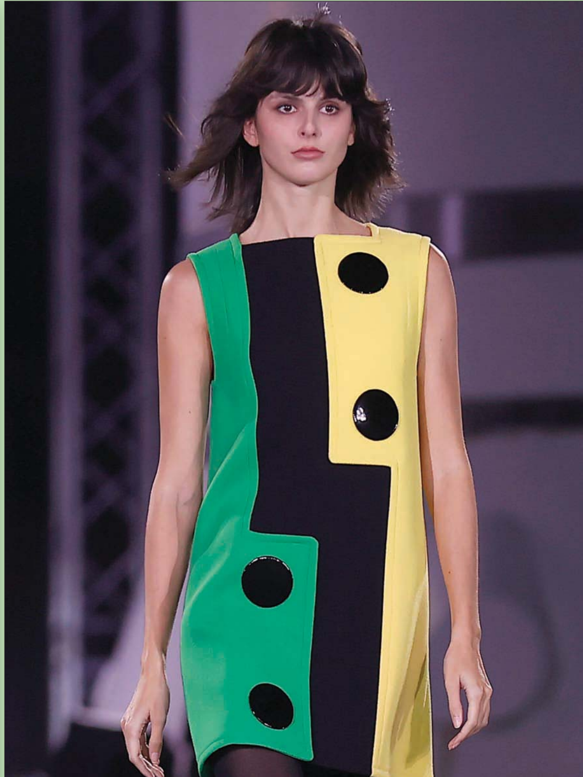
عارضة تقدم زياً من تصميم الراحل بيير كاردان لم يعرض من قبل في نهاية عرض أزياء الربيع والصفيف في باريس

فيما فقد لبنان جميع أصدقائه وشركائه الطبيعيين والتاريخيين، عوض عنه التمتع بصداقة فنزويلا، والتساوي معها في مستوى العيشة، ومستوى النقد، ومستوى الرواتب، ومستوى ارتفاع الثلوج التي تلف مخيمات اللاجئين قبل أن تتركها للعواصف والصقيع. كان لبنان شريكاً حقيقياً لجميع الدول العربية حتى خلال الاحتلال الإسرائيلي، بقى له شيء من احترام ومن عطف ومن سيادة ومن جوهر الدولة. الآن لم يبق له شيء، حتى في الشكل، حتى في الاسم. معروف عن الدورز أنهم يغربون أحرف الألفباء حتى لا يلتفتوا بكلمة نابية. غير وليد جنلاط القاعدة الذهبية على التلفزيون ليقول بدون تعديل في الأحرف، أو الكلمات، «حرق... ميشال عون».