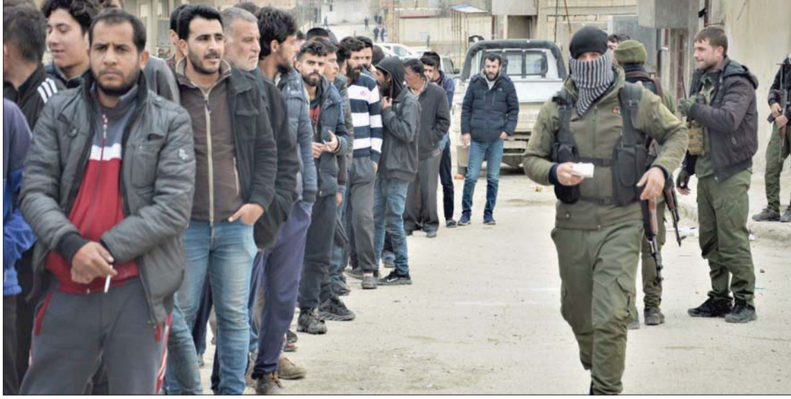
عناصر من «قوات سوريا الديمقراطية» ومدنيون في الحسكة أول من أمس (أ.ف.ب)

عقد مسؤولان أميركيان اجتماعاً افتراضياً مع قادة «قوات سوريا الديمقراطية» و«مجلس سوريا الديمقراطية»، بعد التمرد المسلح الذي شهده سجن الصناعات بحى غويران جنوبي مدينة الحسكة الشهر الحالي.