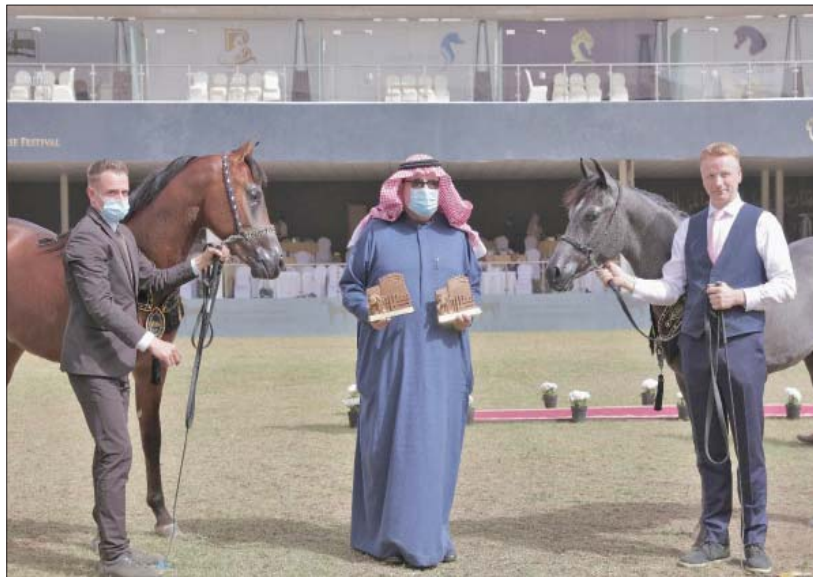
الأمير عبد العزيز بن أحمد بن عبد العزيز خلال مراسم التتويج (الشرق الأوسط)

العزيز كما حقق المهر «مهاجر عذبة» إنتاج «مربط عذبة» والعائد لمربط عذبة للأمير عبد العزيز بن أحمد بن عبد العزيز فضية بطولة الأمير بإجماع الحكام، وحقق المهر «فزاز العارض» العائد لأمجد الغشيان برونزية الأمير. كما حققت الفرس «غلا دبراب» العائدة لفهد بن ناصر المنيع بطولة الأفراس والميدالية الذهبية وحققت الفرس «بهمة عذبة» إنتاج «مربط عذبة» والعائدة لعماد آل رشيد فضية الأفراس، كما حققت الفرس «بدوية الثالثة» العائدة لأمجد الغشيان برونزية الأفراس.