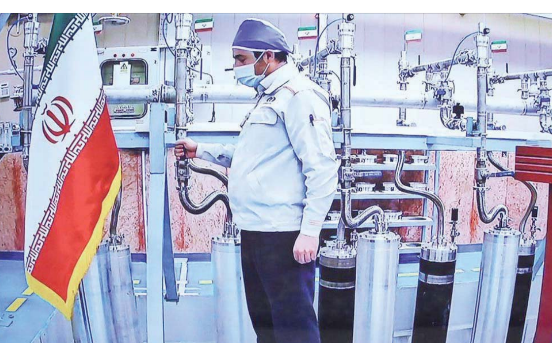
منشأة نظذ النووية في إيران

هي مشكلة». ورداً على سؤال حول ما إذا كانت إسرائيل قادرة بمفردها على ضرب إيران، قال إيزنكوت: «الامر معقد». واستمر الجنرال السابق في انتقاد رئيس الوزراء الإسرائيلي الحالي، نفتالي بينيت، لاستبعاده لقاء