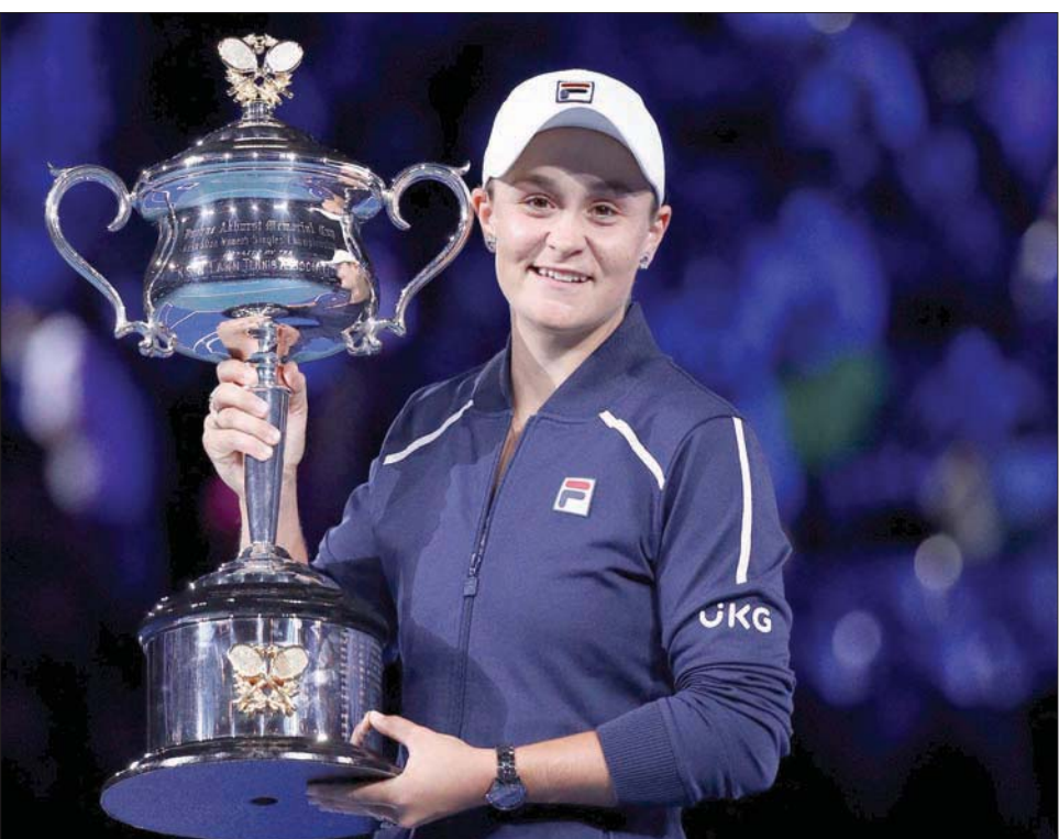
بارتي تحتفل بالتتويج بكأس بطولة أستراليا المفتوحة

«أهني أشلي على هذه البطولة الرائعة، بالأحرى على السنوات الرائعة». وتابعت الالعب التي ستعود بين العشر الأوليات في تصنيف الالعب المحترفات: «أمل أن أقتدي بطريقة لعبك وتنويع ضرباتك». وهذا الفوز الرابع لبارتي على كولينز في 5 مباريات بينهما. وفي منافسات الرجال، يريد الروسي دانييل مديفيد أن يقف حائلاً دون وصول الإسباني نادال الساعي إلى لقبه الحادي والعشرين في بطولات «غران سلام» (رقم قياسي، عندما يتواجهان اليوم في النهائي. وسبق لمديفيد أن أجاد هذا الدور عندما حرم الصربي نواك ديوكوفيتش من إحرز لقبه الكبير السادي والعشرين، والانفراد بالرقم القياسي في عدد الألقاب الذي يتساوى فيها مع نادال