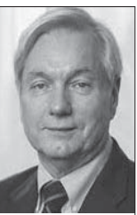
أزكيل إيهانويل: مايكل أوسترهولم

بسرعة، وقد تصبح سريعة الانتشار. وبحسب ما أظهرت الأبحاث الأخيرة في مدينة «شيان»، فإن المستشفيات الصينية التي تشفى الفيروس قد تحرم المحتاجين من الرعاية.