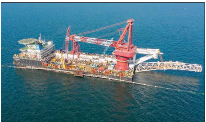
تعتمد المرحلة الانتقالية لألمانيا بنسبة كبيرة على الفحم ولا يمكن الاستغناء عنه بحلول 2030 إلا إذا كانت هناك إمدادات أخرى مثل الغاز