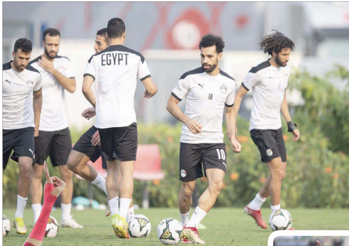
صلاح نجم مصر (الثاني يميناً) مع زملائه بالمنتخب خلال التدريب لمواجهة المغرب

حجزت الكاميرون أول بطاقات نصف نهائي كأس أمم أفريقيا لكرة القدم التي تستضيفها إثيوبيا فوزها على غامبيا بهدفين نظيفين أمس، بينما سيخوض منتخب مصر حامل الرقم القياسي في عدد الالقاب القارية (7) لقاء قمة مع نظيره المغربي هو الأقوى بالدور ربع النهائي اليوم، في حين ستكون السنغال مرشحة لتخطي غينيا الاستوائية. على ملعب مدينة دولا نجحت الكاميرون صاحبة الأرض في إنهاء مغامرة غامبيا حديثة المشاركة في النهائيات وخرجت منتصرة بفضل ثنائية كارل توكو إيكامبي مهاجم ليون الفرنسي. ويعد شوط أول سليلي نجح إيكامبي في التسجيل مرتين بالدقيقتين 50 و57. لتصبح الكاميرون أول المنتخبين المتأهلات للقاء الأخير. لكن المغرب يتفوق بثلاثة انتصارات مقابل فوزين لمصر خلال ست مواجهات بينهما في البطولة القارية، وتعادل واحد. وفي الوقت الذي يطمح فيه منتخب مصر، صاحب الرقم القياسي في عدد مرات الفوز بكأس الأمم الأفريقية (7 القاب)، لحسم بطاقة نصف النهائي للمرة الثانية في النسخ الثلاث الأخيرة، فإن المنتخب المغربي، بطل المسابقة عام 1976، يحلم بالوجود في هذا الدور للمرة الأولى منذ 18 عاماً.