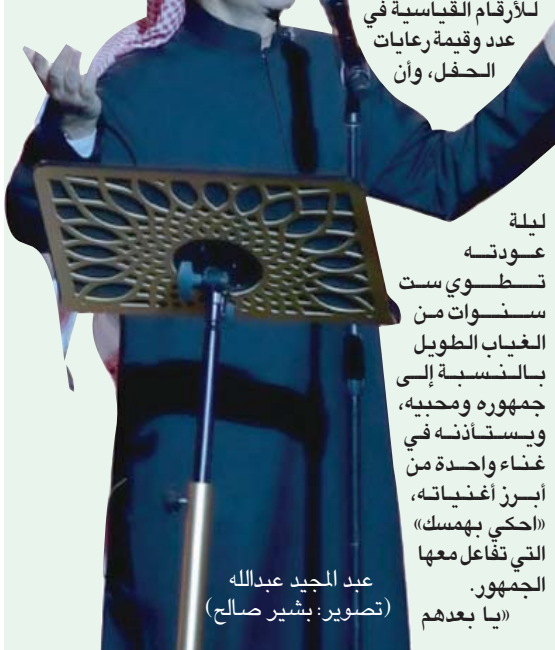
عبد المجيد عبد الله

ب«خلص حنانك» يختم عبد المجيد عبد الله، ليلة الأولى ضمن أمسيات العودة على مسرح «محمد عبده أرينا» في الرياض، ويودع جمهوره والعرض، على أمل أن يستمر اللقاء بهم ويودع.