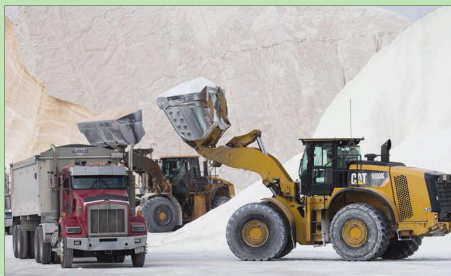
جرارات تعبئ ملحاً خاماً في ولاية ماساشوستس تحسباً للعاصفة المتوقعة

وتجنبوا السفر غير الضروري». وقال مركز الأرصاد الجوية، إن العاصفة التي يتوقع أن تشتد بسرعة خلال الساعات الـ24 المقبلة ستؤدي إلى انخفاض كبير في درجات الحرارة.