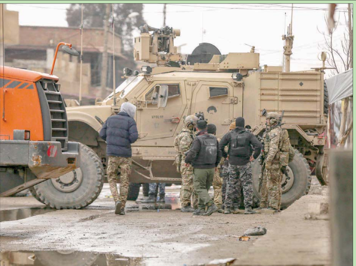
جنود أميركيون وعناصر في «قوات سوريا الديمقراطية» بحي غويران في الحسكة أمس

الكويت، ميرزا الخويلدي بيروت، «التشرق الأوسط»