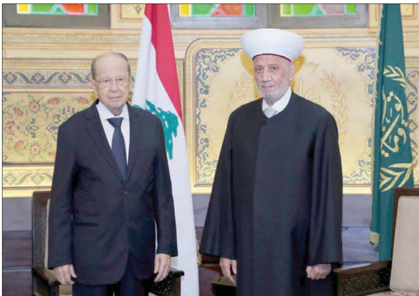
الرئيس ميشال عون والمفتي عبد الطيف دريان خلال لقائهما أمس (اللاي ونهرا)

كان حزب «القوات» اللبناني، انشق، أمس، عن مصادر قولها إن الرسالة ستقول إن لبنان لن يكون منطلقاً للتحركات التي تمس بالدول العربية، وإنها ستعزز الإجراءات لمنع تهريب المخدرات، لكنه لن يحدد في الوقت عينه أي خطوات نحو تنفيذ القرار 1559. وذكرت مصادر مطلعة على الرسالة أن بيروت ستقول إن «لبنان لن يكون منطلقاً للتحركات التي تمس بالدول العربية». كما أن لبنان يحترم كافة قرارات الشرعية الدولية