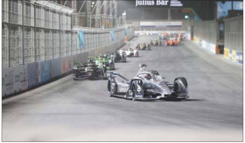
جانب من سباق الجولة الثانية لفورمولا الدرعية إي (الشرق الأوسط)

وشهد السباق حضوراً جماهيرياً لافتاً كما جرت العديد من الفعاليات لجميع الأعمار