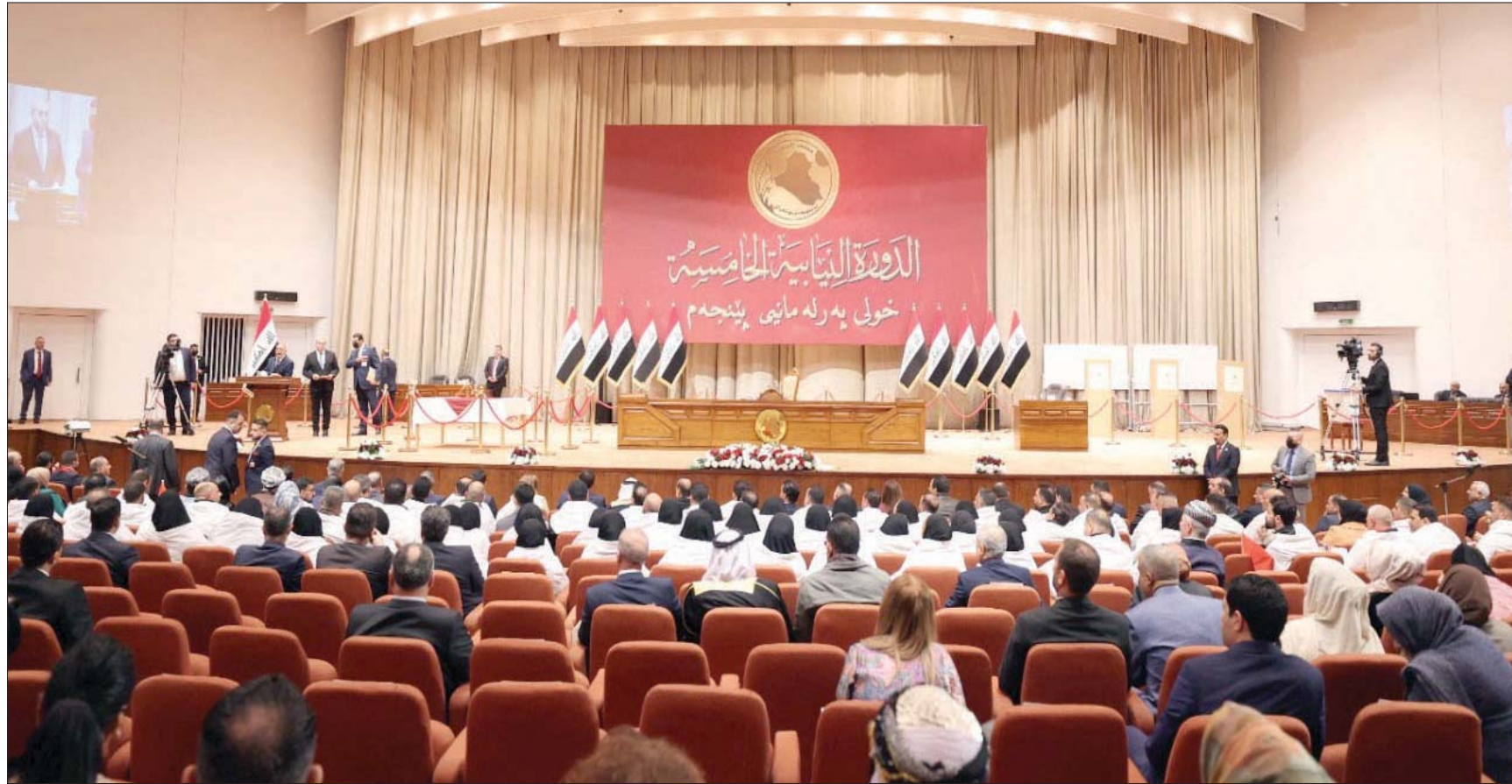
يعد الرئيس الحالي د. برهم صالح، ووزير الخارجية والمالية والقيادي البارز في الحزب الديمقراطي الكردستاني هوشيار زيباري أبرز المرشحين لمنصب الرئاسة

خلال نقل اختلافات الرأي إلى بغداد. وقال في بيان: «هناك أطراف لا تريد الخير للعراق عموماً والشعب الكردستاني خصوصاً تسعى لاستغلال الخلافات داخل البيت الكردي لتحقيق مكاسب خاصة تضر بالوضع الكردي». وبالرغم من أن الحزب الديمقراطي الكردستاني كره أكثر من مرة أن مرشحه للمنصب الحاصل بين الحزبين الكرديين، عن ائتلاف دولة القانون بزعامة نوري المالكي، إلى هيئة الزهراء وثائق تزعم أنها تتعلق بنهم «فساد» ضد زيباري. إلى ذلك، أكد الباحث العراقي، رئيس المجلس الاستشاري العراقي، لـ«الشرق الأوسط» أن المناقشة على كرسى الرئاسة ستكون على أشدها مع اقتراب موعد اختيار