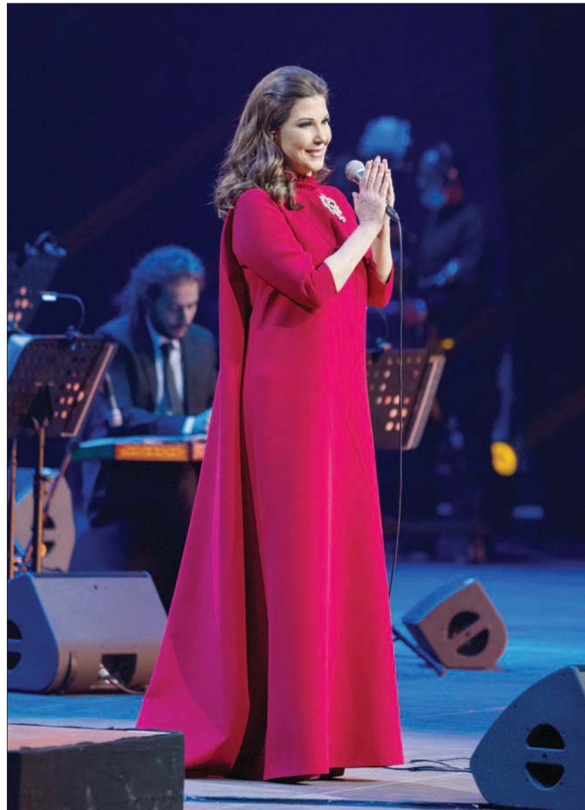
ماجدة الرومي تشدو على مسرح المريا في الغلا بـ17 أغنية تدهش التواقين للطرب الأصيل

بالقول: «اخترناو ساحة المعارك التي لا أعرف لماذا لا تنتهي، ونحن ذخيرتها الحية».