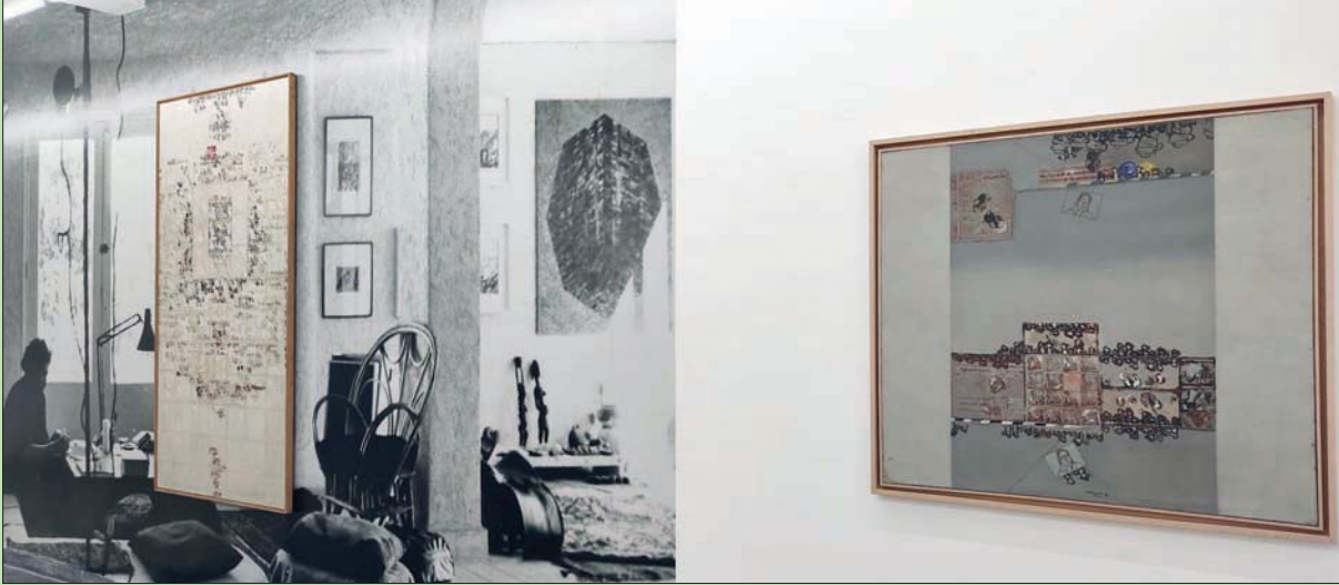
جانب من معرض «العمل مكشوفاً» في مراكش