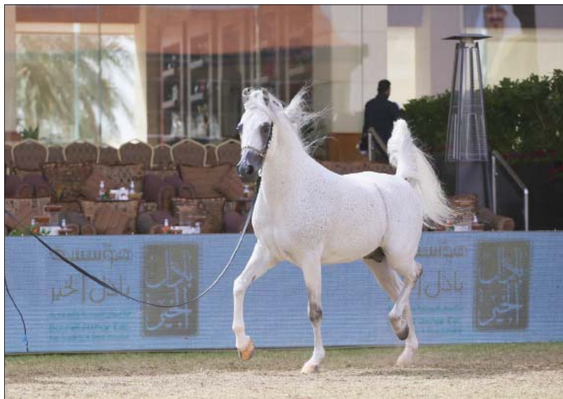
المنافسة على ألقاب المهرجان شملت 270 جواداً