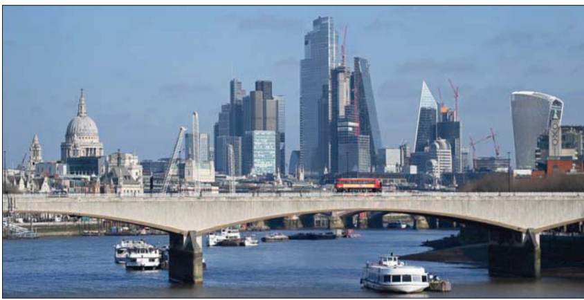
حي المال في لندن (إ.ب.)

جعلت الرئيس بوتين أكثر جرأة. وقال تقرير اللجنة نشر في 2018 بعنوان «ذهب موسكو» إن أفضل طريق لكبح الأطماع الإقليمية الروسية هي وقف الكرمين عن غسل الأموال غير القانوني في المملكة المتحدة والمناطق البريطانية ما وراء البحار. وفي التقرير، يرى الناشط في مجال مكافحة الفساد رومان بوريوسوفيتش أن جميع «الأوليغارش» الروس ينتمون إلى «الطبقة» نفسها التي تدين بشيء ما للكرمين، وفق وكالة الصحافة الفرنسية. ويقول: «همها بدوا مختلفين - أحدهم يمتلك نادياً لكرة القدم، وآخر تبرع بالمال إلى أكسفورد لبناء مدرسة حكومية، وثالث سجن في روسيا لسنوات في ظل الشيوعية، وسواه كان موظفاً حكومياً - فجميعهم لديهم أشياء معينة مشتركة». ويضيف «كل