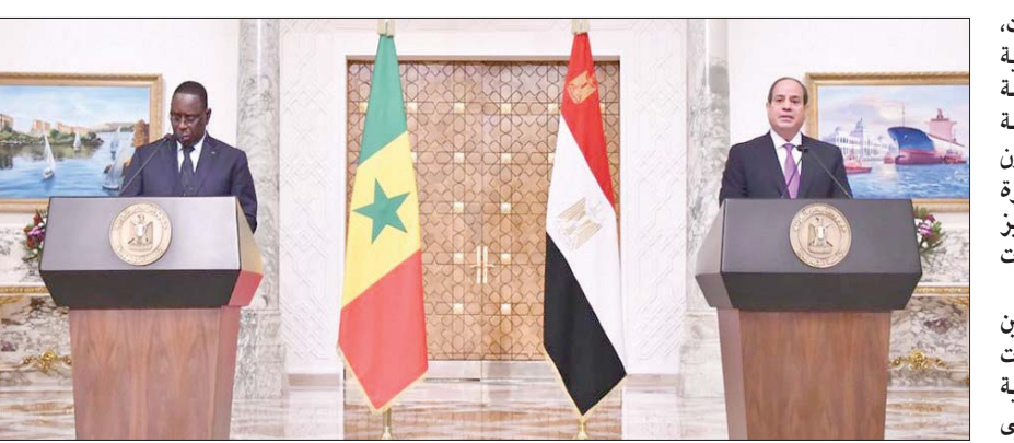
الرئيس المصري ونظيره السنغالي خلال المؤتمر الصحافي أمس