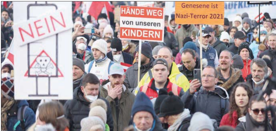
معارضون للتلقيح ضد «كورونا» يتظاهرون في فيينا يوم 8 يناير الجاري

بلدان أخرى، بهدف إعادة «الثقة» تدريجياً. وقال بهذا الصدد «إننا صدركون» أن العملية ستستغرق أشهراً، بل سنوات». كما يتحتم على الوكالة معالجة قصورها على صعيد مكافحة الإرهاب. وكشف التحقيق حول اعتداء فيينا الذي نفذه مهاجم من أنصار تنظيم «داعش» في نوفمبر (تشرين الثاني) 2020 عن ثغرات في عمل جهاز الاستخبارات الداخلية الذي لم يستجب لتحذيرات عديدة صدرت عن أجهزة استخبارات دول مجاورة خلال الأشهر التي سبقت الحادث الإرهابي.