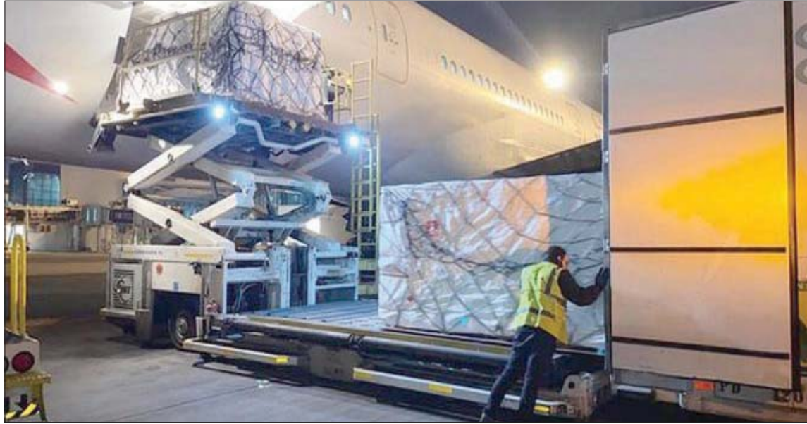
مصر تستلم جرعات لقاح «أسترازينيكا»