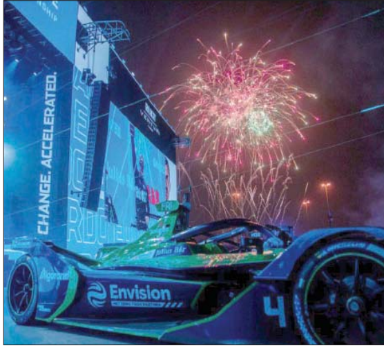
ألعاب نارية أطلقت في سماء الدرعية خلال التتويج