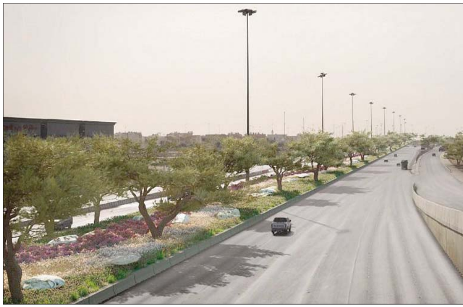
تتوقع وزارة البيئة أن تسهم الغرض المطروحة في توفير عدد كبير من الأشجار الملائمة لطبيعة السعودية (واس)

وعلى قدر اهتمام البلاد بشؤون بيئتها محلياً، وأطلقت تحديراً لبحث مدى تعاضد المجتمع الدولي تجاه المخاطر المحدقة بكونك الأرض بيئياً ومناخياً، واستشعار ضرورة الوصول إلى حلول ناجعة وفق منظور أمني تغلب فيه مقومات الحياة واستدامتها على أساس أنها «قضية دولية» تحث بتأثيرها على وجه البسيطة وقاطنيتها. وتشاطر السعودية دول العالم فيما تواجهه من تحديات بيئية متنامية نتيجة للتزايد السكاني وتوسع الوتيرة الصناعية والاقتصادية والعمالية والزراعية، فسعت جاهدة للحد من مسببات التغير المناخي، والوفاء بالتزامها بالمعايير والاتفاقيات الدولية في إطار البرامج الدولية المنبثقة عن المنظمات المتخصصة، ومنها اتفاق باريس لتغيير المناخ الرامية لتجنب التبدلات الخطيرة الناشئة عن أنشطة بشرية في النظام المناخي. وأمام هذه التحديات العالمية، جاء تأكيد الملك سلمان بن عبد العزيز خادم الحرمين الشريفين، خلال رئاسة السعودية لمجموعة العشرين العام الماضي، أن البلاد شجعت إطار الاقتصاد الدائري للكربون الذي يمكن من خلاله إدارة الانبعاثات بنحو شامل ومتكامل بهدف تخفيف حدة آثار التحديات المناخية، وجعل أنظمة الطاقة أنظف وأكثر استدامة، وتعزيز استقرار أسواق الطاقة.