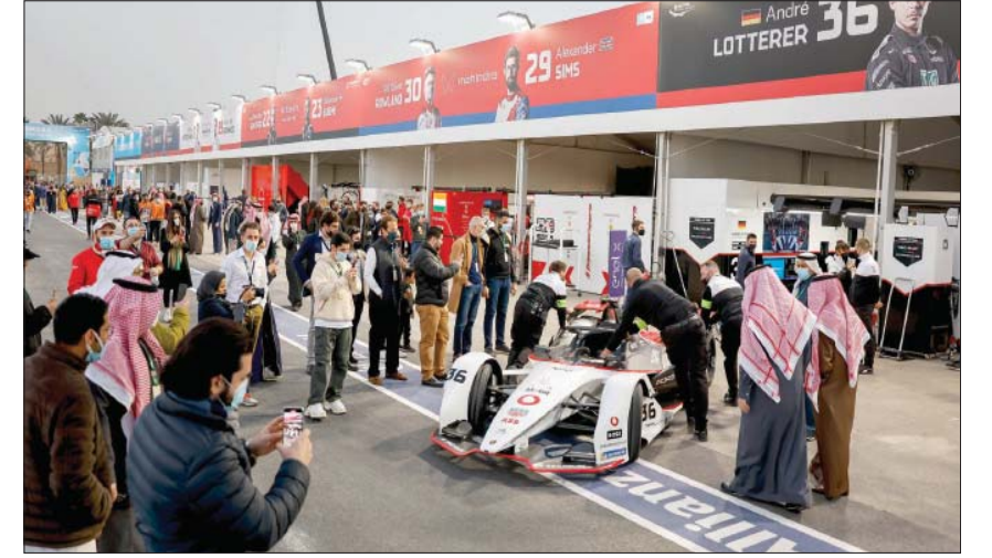
جماهير تلتقط صوراً للسيارات المشاركة قبل انطلاق السباق (الشرق الأوسط)