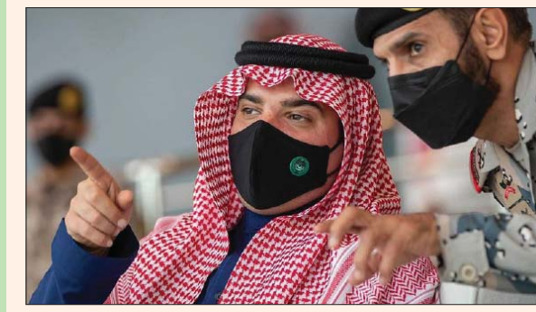
الأمير عبد العزيز بن سعود وزير الداخلية السعودي

قواتنا الأمنية وتوحيد الجهود لرفع الجاهزية». ونوه الأمير عبد العزيز بن سعود في كلمته بالجهود الأمنية الكبيرة في مواجهة جائحة «كورونا»، مبيّناً أن التمرين يأتي بعد مواجهة ناجحة للجائحة تمكنت خلالها الأجهزة الأمنية في دول مجلس التعاون الخليجية من تجنب مخاطر تفشي الفيروس، ورسالتنا التي نتفق على مضمونها جميعاً أن أمن دول مجلس التعاون لدول الخليج العربية كل لا يتجزأ، ويغفل بسبق الأقوال تظهر همم الرجال».