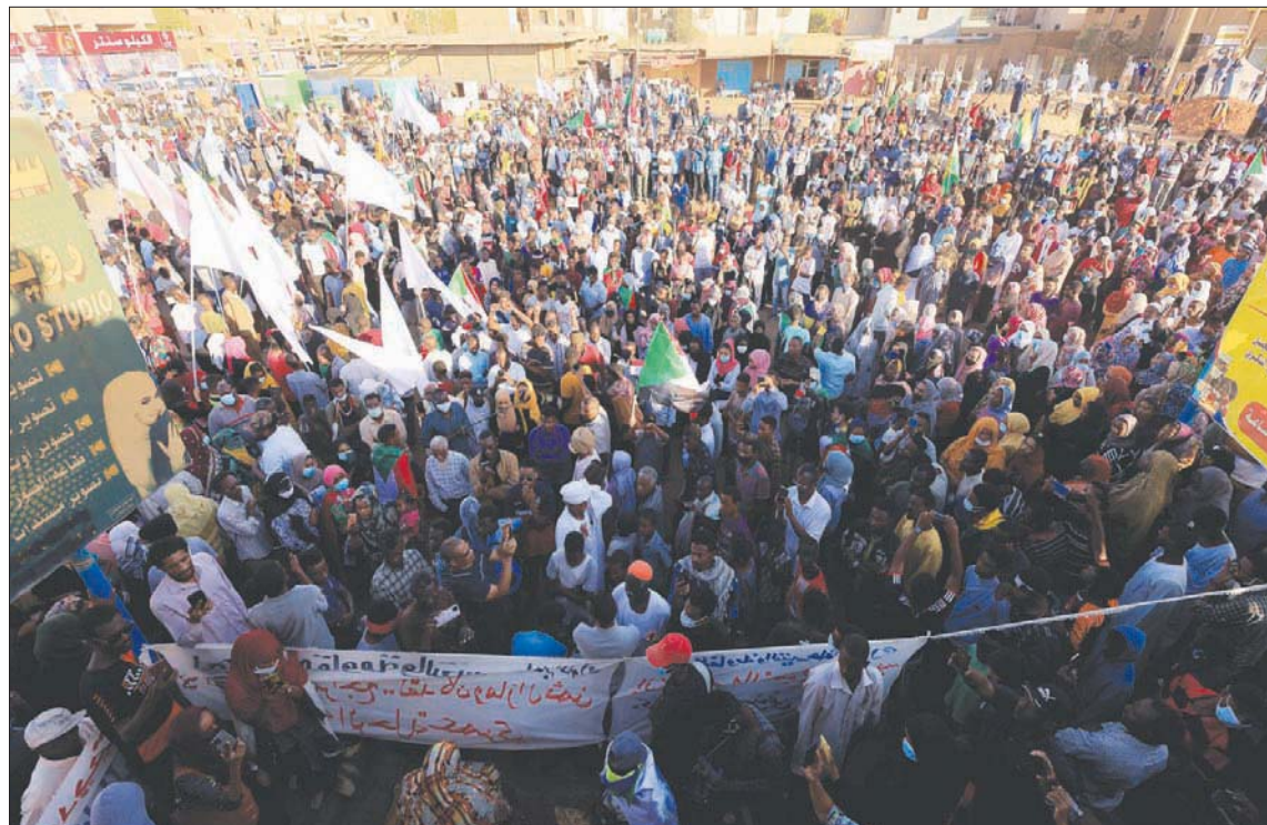
جانب من المظاهرات الحاشدة في شوارع الخرطوم أمس

يووقف القتل والاعتداء ضد المتظاهرين، فيما أكدت قيادات سياسية بالمدنية خاطبت الحشود على «سلمية المظاهرات حتى إسقاط الانقلاب العسكري».