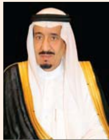
الرياض، «الشرق الأوسط»

خادم الحرمين يتلقى رسالة خطية من رئيس جنوب السودان