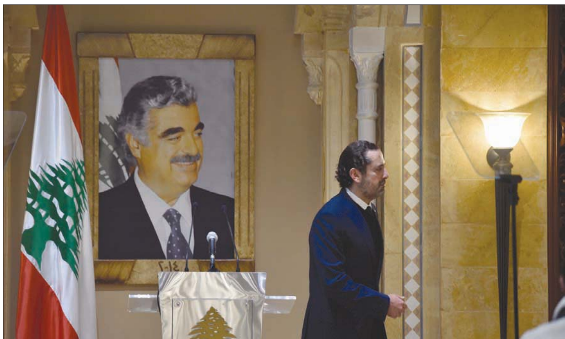
الحريري في نهاية مؤتمره الصحفي أمس

تحمّل المسؤولية أيضاً، ولأنني متقنع بأن لا مجال لأي فرصة إيجابية للبنان في ظل النفوذ الإيراني والتخبط الدولي، والانقسام الوطني واستعمار الطائفية واهتراء الدولة، أعلن، تعليق عملي بالحياة السياسية ودعوة عائلتي في تيار المستقبل لاتخاذ الخطوة نفسها، وعدم الترشح للانتخابات النيابية وعدم التقدم بأي ترشيحات من تيار المستقبل أو باسم التيار».