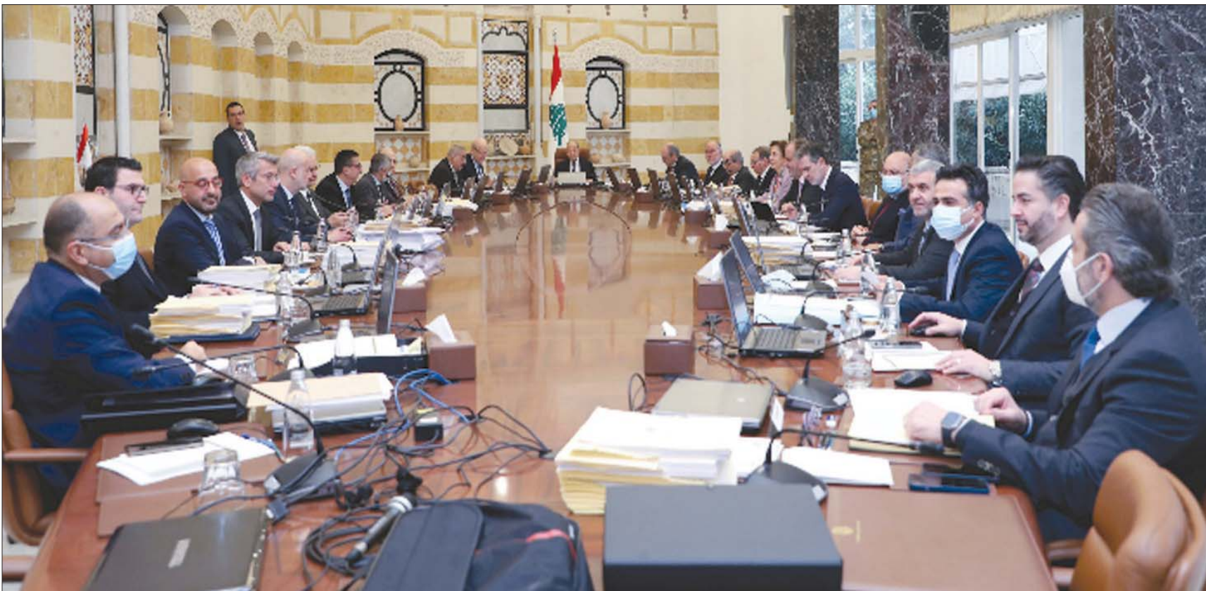
مجلس الوزراء مجتمعاً برئاسة عون أمس

واعتبر رئيس الجمهورية ميشال عون في الجلسة التي عقدت في القصر الرئاسي، أن «انقطاع جلسات مجلس الوزراء أثر سلباً على انتظام عمل السلطة التنفيذية وزاد في تراكم الانعكاسات السلبية على الوضع العام في البلاد»، مشيراً إلى أن «ما حصل في الأشهر الماضية لم يكن وفق القاعدة الدستورية القاضي بالفصل بين السلطات التنفيذية والتشريعية والقضائية»، في إشارة إلى تعطيل الحكومة على خلفية رفض التناهي الشيعي (حزب الله وحركة أمل) التحقيقات في قضية انفجار المرفأ والسعي لإطاحة بالمحقق العدلي طارق البيطار. من جهته، أعلن رئيس الحكومة نجيب ميقاتي أن