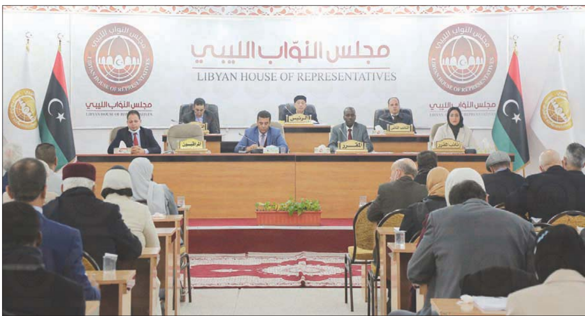
جلسة مجلس النواب الليبي أمس بمقره في مدينة طبرق

وأكد اللافي على «أهمية مشروع المصالحة الوطنية التي أطلقتها المجلس الرئاسي، وحرصه على إجراء الانتخابات الرئاسية هذا العام»، ونقل عن الوفد الإيطالي أن حكومته، التي تتابع عن كثب مجريات الأحداث في ليبيا، ترغب في العمل على مساعدتها في الخروج من المرحلة الانتقالية إلى مرحلة الدولة، بانتخاب رئيس يجمع عليه الشعب الليبي.