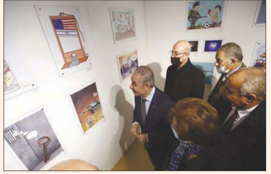
أشيتية يفتتح معرض «فلسطين ياسر عرفات» بمشاركة رسامي كاريكاتير من العالم

العالم، خصوصا الشعوب والدول العربية والإسلامية، التي هي موضع احترامها وتقديرها». وجددت تأكيدها على أن «صراعها مع العدو الصهيوني» داعية إلى «تجنب الشعب المجاهد أي صراعات أخرى». موقف حماس الرسمي الذي أعيد نشره من مسؤولين في الحركة، على مواقع التواصل الاجتماعي وذكرها بالاسم، مسؤولا آخر كان صرح ضد الدول العربية، وقالوا: «إنه يمثل نفسه». أظهر وجود تباين بين تيارين في الحركة، واحد يميل إلى استعادة العلاقات كاملة مع إيران، والثاني يعارض ذلك، علما بأن الخلاف بين التيارين، قديم، بدأ منذ أعوام عندما توسط حزب الله اللبناني ونجح في إعادة العلاقة بين طهران وحماس، بعد سنوات من القطيعة بسبب الخلاف حول تأييد النظام السوري. وشهدت العلاقة خلال السنوات القليلة الماضية، مدا وجزا في وقت ظلت فيه متوترة مع السلطة الفلسطينية، إذ اهتمت طهران أكثر من مرة بتغذية الانقسام الفلسطيني.