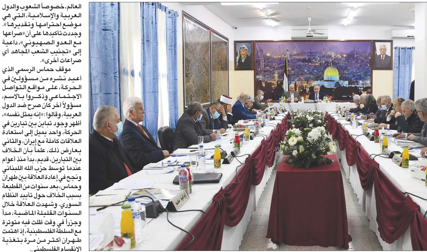
مجلس الوزراء الفلسطيني برئاسة رئيس الوزراء محمد اشتية في اجتماعه أمس (وفا)

العالم، خصوصا الشعوب والدول العربية والإسلامية، التي هي موضع احترامها وتقديرها». وجددت تأكيدها على أن «صراعها مع العدو الصهيوني» داعية إلى «تجنب الشعب المجاهد أي صراعات أخرى». موقف حماس الرسمي الذي أعيد نشره من مسؤولين في الحركة، على مواقع التواصل الاجتماعي وذكرها بالاسم، مسؤولا آخر كان صرح ضد الدول العربية، وقالوا: «إنه يمثل نفسه». أظهر وجود تباين بين تيارين في الحركة، واحد يميل إلى استعادة العلاقات كاملة مع إيران، والثاني يعارض ذلك، علما بأن الخلاف بين التيارين، قديم، بدأ منذ أعوام عندما توسط حزب الله اللبناني ونجح في إعادة العلاقة بين طهران وحماس، بعد سنوات من القطيعة بسبب الخلاف حول تأييد النظام السوري. وشهدت العلاقة خلال السنوات القليلة الماضية، مدا وجزا في وقت ظلت فيه متوترة مع السلطة الفلسطينية، إذ اهتمت طهران أكثر من مرة بتغذية الانقسام الفلسطيني.