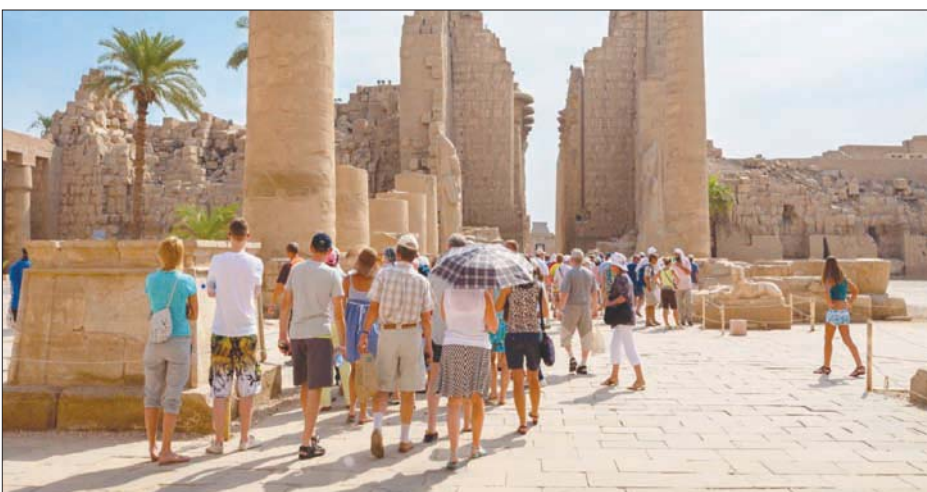
ينتظر قطاع السياحة في مصر خلال العام الجاري افتتاح المتحف المصري الكبير ومشروع التجلي الأعظم في سيناء، ومنتج الجلالة على شاطئ البحر الأحمر

وقطاع السلع الهندسية والإلكترونية بقيمة ثلاثة مليارات و387 مليون دولار مقابل 2 مليار و315 مليون دولار خلال عام 2020 بنسبة زيادة بلغت 46 في المائة وقطاع المنتجات الكيماوية والأسمدة بقيمة ستة مليارات و702 مليون دولار مقابل أربعة مليارات و614 مليون دولار خلال عام 2020 بنسبة زيادة بلغت 45 في المائة.