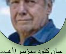
جان كلود ميزيير (أ.ف.ب)

وأضافت: «يرتبط اسم ميزيير بشخصيَّتي فاليريان ولورلين اللذين شارك في ابتكارهما ورسمهما لأكثر من 50 عاماً جنباً إلى جنب مع كاتب السيناريو وصديقه القديم بيار كريستان».