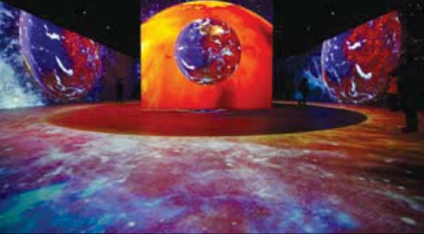
عرض يدعو الزوار إلى استكشاف عبقرية ليوناردو دافنشي في برلين

استكشاف ابتكارات وأفكار الرسام والمثال والمهندس المعماري وخبير التشريح والميكانيكي والمهندس استكشافاً كاملاً بطريقة جديدة تماماً في مساحات كبيرة مليئة بالإضاءة حيث يكون الزوار محاطين بالأصوات والمرئيات من جميع الجوانب.