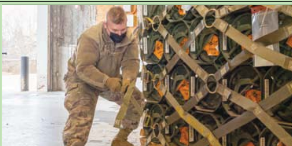
صورة وزعها سلاح الجو الأميركي أمس لشحنة أسلحة ونخائر قبل نقلها إلى أوكرانيا في إطار الدعم العسكري الأميركي المتزايد لها في مواجهة غزو روسي محتمل (تفاصيل ص 11)