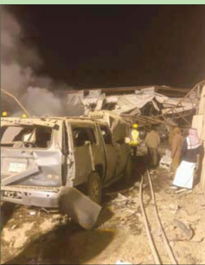
آثار العدوان الحوثي الذي استهدف منطقة صناعية بطهران الجنوب فجر أمس

وأكد الحرف، أن استمرار هذه الاعتداءات الإرهابية التي تقوم بها