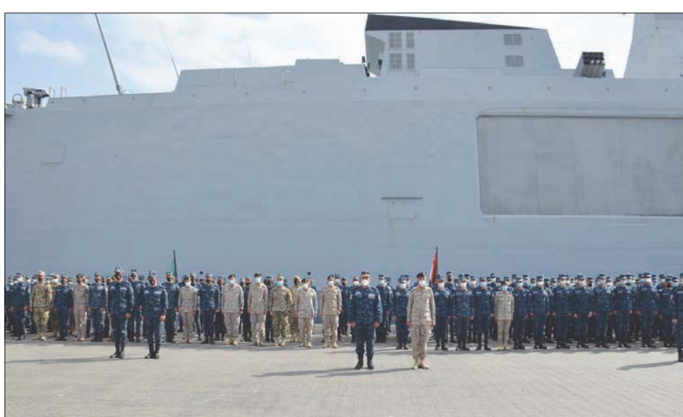
جانب من تدريب «مرجان 17» البحري بين مصر والسعودية (المتحدث العسكري المصري)

القاهرة، «الشرق الأوسط» انطلقت فعاليات التدريب البحري المشترك السعودي - المصري (مرجان - 17)، والذي تجرى فعالياته بالمملكة العربية السعودية، ويستمر لعدة أيام، ويأتي في إطار خطة التدريبات المشتركة للقوات المسلحة في البلدين. وقال بيان عسكري مصري، إن التدريب يتضمن «عقد العديد من المحاضرات النظرية والمؤتمرات التدريبية، وتنفيذ العديد من البعثات العملية والأنشطة منها تنفيذ عدة رمايات تكتيكية للقوات الخاصة البحرية لكلا الجانبين بمختلف الأسلحة الصغيرة، فضلاً عن تنفيذ رماية مدفعية سطح - سطح على هدف سطحي وتنفيذ رماية سطح جو على هدف جوي، وتنفيذ تشكيلات إبحار».