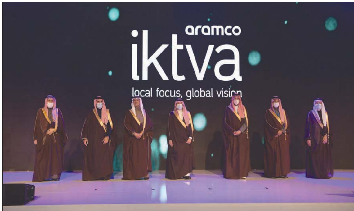
الأمير سعود بن نايف والأمير عبد العزيز بن سلمان والأمير أحمد بن فهد وبندر الخريف وياسر الرميان وأمين الناصر خلال تدشين النسخة السادسة من معرض «اكتفاء»

الظهران، بندر مسلم كشف الأمير عبد العزيز بن سلمان بن عبد العزيز وزير الطاقة السعودي، عن قرب تشكيل لجنة لتوطين قطاع الطاقة في البلاد تحت مظلة اللجنة العليا لشؤون مزيج الطاقة لإنتاج الكهرباء وتمكين قطاع الطاقة المتجددة برئاسة الأمير محمد بن سلمان بن عبد العزيز، ولي العهد في البلاد، وذلك لتحقيق تماسك أكبر وتعزيز سبل التعاون بين مختلف الجهات المعنية. وأكد وزير الطاقة أن النهج الشامل والمشارك مكن من تجاوز تحديات مشروعات وطنية كبيرة مثل برنامج كفاءة الطاقة، وتكامل قطاع الكهرباء، ومبادرة الاقتصاد الدائري للكربون.