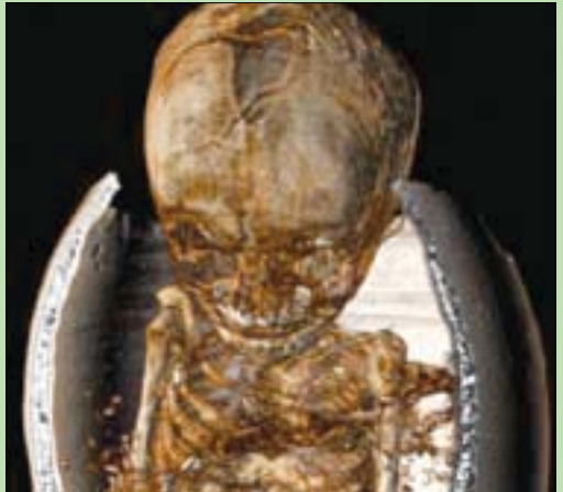
صورة بالأشعة تظهر تفاصيل الجزء العلوي من المومياء

التحريم قبل أكثر من قرن. وكان الدفن في أوعية ممارسة معروفة في مصر القديمة، بالنسبة للأطفال، كما دُفن الأطفال أيضاً في توابيت خشبية، وأشارت دراسات سابقة إلى أن أوعية الدفن التي تأخذ شكل ما يعرف باسم «أمفورا»، كانت في الأصل لأغراض منزلية، ثم تمت إعادة تدويرها لاستخدامها في الدفن، وهو ما قد يشير إلى مستوى اجتماعي واقتصادي منخفض.