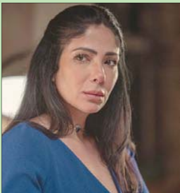
منى زكي في مشهد من فيلم «أصحاب ولا أعز» على «تفليكس»

بدرورها، نشرت المطربة اللبنانية إليسا تغريدة على حسابها على تويتر، قالت فيها «لماذا نعود إلى الوراء؟ أفلامنا كانت تحوي على العري والقبليات والمشاهد الجنسية، وكنا نقبلها ونشاهدها دون أزمات، من لا يعجبه الفيلم لا يشاهده، المنصة ليست إلزامية والفيلم متوفر لمن يريد، وأنا أحببة كثيراً». ورغم أن الفيلم