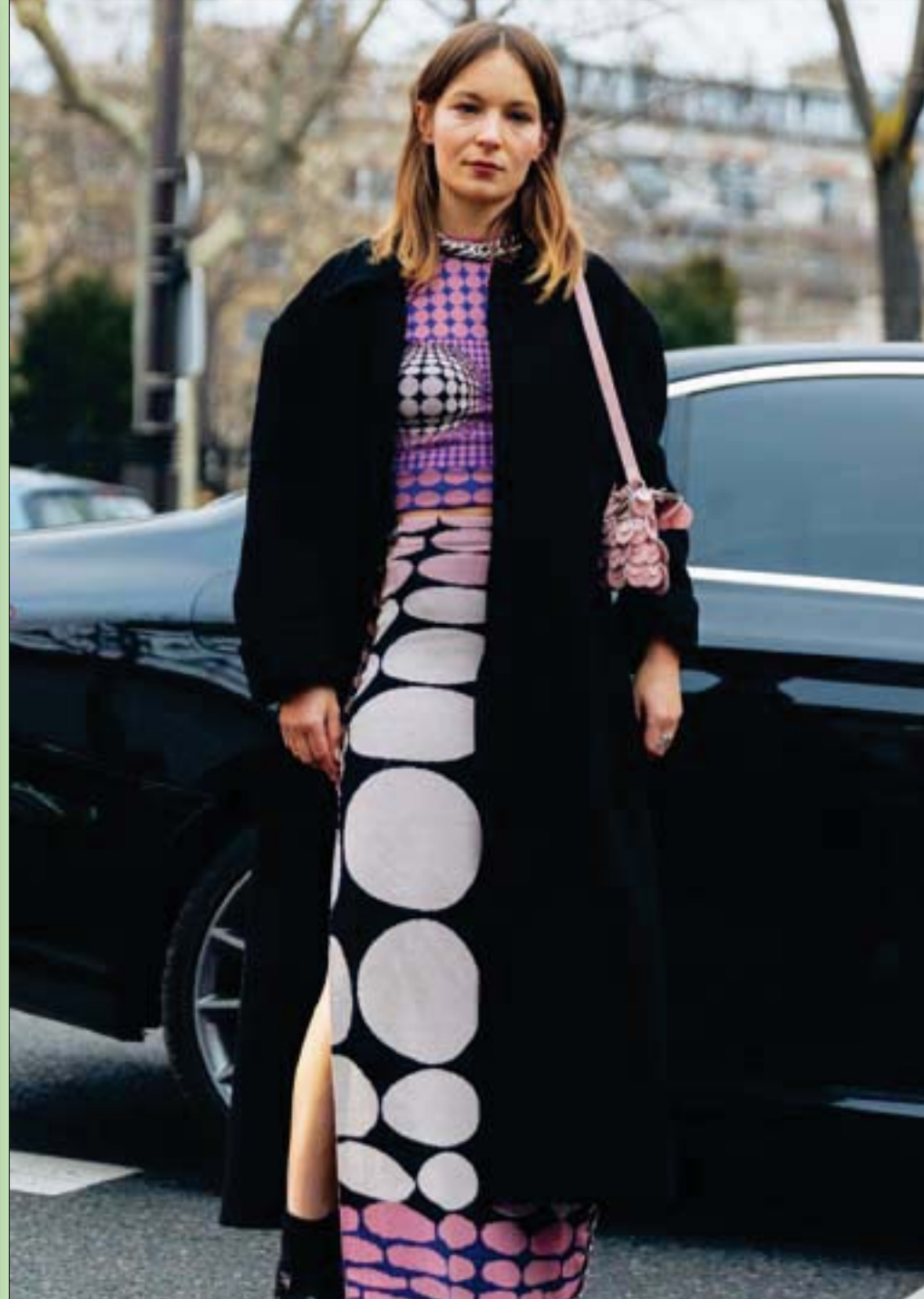
المثلة الفرنسية ديان روكسيل في عرض لـ«باكو رابان» في باريس

وأضافت أن أبناءها الآن متزوجون، وأن الإبل رافقتها في رحلتها، ولم تفارقها طوال تلك المدة، مؤكدة أنها تعيش معها في أمان وتسناس بها، وتقول: فمثلما هذه الإبل تحن لي إذا فارقتها، فإنني أيضاً لا أتخيل حياتي بدونها، حتى لو أعطوني كنوز (قارون).