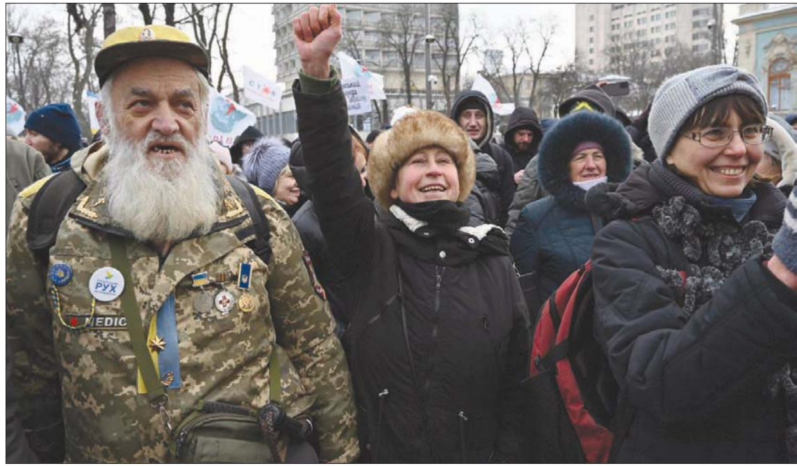
أوكرانيايون يحتجون أمس أمام البرلمان في العاصمة كييف ضد فرض إلزامية اللقاح ضد «كورونا» (أ.ف.ب)

قالت إن الجائحة لن تنتهي في القريب المنظور