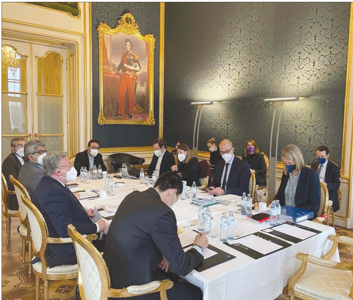
صورة نشرها السفير الروسي ميخائيل أوليانوف من اجتماع الوفد الإيراني ومفاوضي «1+4» بفندق «بالاس كوبورغ» وسط فيينا أمس

ومجدداً، التقى المتحدث باسم وزارة الخارجية الإيرانية، سعيد ختبي زاده، أمس، باليوم على الولايات المتحدة في بءة وثيرة المحادثات غير المباشرة بشأن إحياء الاتفاق النووي. وأضاف ختبي زاده في المؤتمر الصحفي الأسبوعي أمس: «السبب الرئيسي وراء الوتيرة البطيئة لمحادثات الاتفاق النووي هو عدم استعداد الولايات المتحدة»، وقال رداً على سؤال بشأن آخر تطورات «فيينا»، إن «المحادثات تتقدم