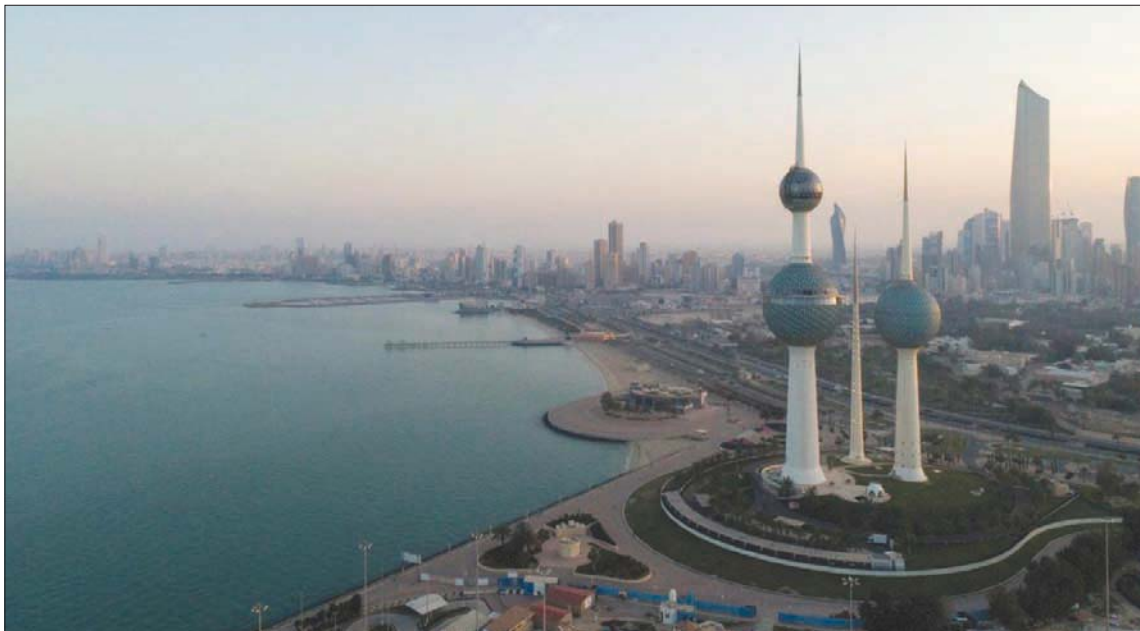
الكويت، الشرق الأوسط

قالت الكويت إن مشروع الموازنة لعام 2022 - 2023 يتوقع دخلاً من النفط يبلغ 16,7 مليار دينار (55 مليار دولار) ارتفاعاً من نحو 9,1 مليار دينار (30 مليار دولار) في 2021 - 2022. وأعلنت وزارة المالية في الكويت أمس عن تقديم مشروع الموازنة العامة للسنة المالية القادمة 2022/2023 إلى مجلس الوزراء، وذلك تمهيداً لإصدار مرسوم الإحالة إلى مجلس الأمة للمداولة والإقرار.