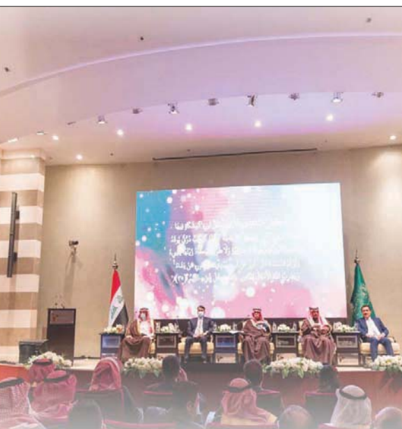
جانب من ملتقى الأعمال السعودي - العراقي أمس بالرياض

الرياض، فتح الرحمن يوسف بينما انطلقت أعمال الاثنين فعاليات ملتقى الأعمال السعودي العراقي المشترك بالعاصمة السعودية الرياض بمشاركة واسعة من الوزراء والمسؤولين وأصحاب الأعمال السعوديين والعراقيين، شهد وزراء سعوديون وعراقيون، على فتح صفحة جديدة في تاريخ التعاون الشامل بين البلدين كافة الصعد، متعهدين بتدليل كافة المشكلات التي تقف أمام انسياب التجارة والاستثمارات بين البلدين، متوقعين زيادة منافذ برية جديدة لتعظيم الشراكة الاستراتيجية بين الرياض وبغداد.