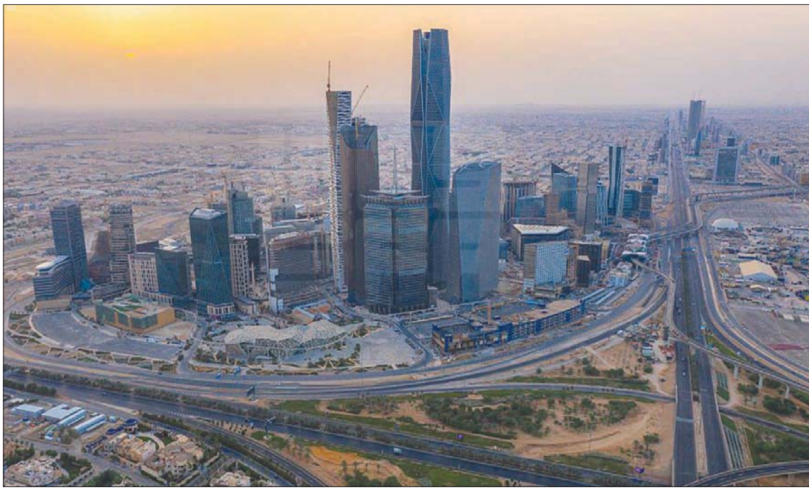
الرياض، الشرق الأوسط

تستضيف السعودية بداية فبراير (شباط) المقبل مؤتمر «الليب» التقني الدولي؛ وذلك لمناقشة تقنيات الرعاية الصحية لتحسين جودة الحياة وزيادة متوسط العمر، وتمكين الإنسان من خلال الروبوتات، والتقنيات المعززة للأمن الغذائي والمائي في المنطقة.