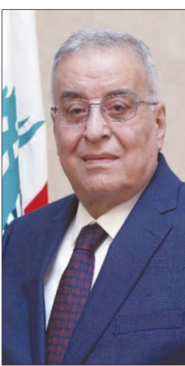
وزير الخارجية عبد الله بوحيب

أعلن وزير الخارجية اللبناني عبد الله بوحيب أنه سيتم البحث في الرسالة العربية التي حملها وزير خارجية الكويت الشيخ أحمد ناصر المحمد الصباح إلى لبنان، على أن يكون الجواب عنها جاهزاً السبت المقبل، في وقت أثنى فيه سياسيون وأحزاب لبنانية على المبادرة، معتبرين أنها فرصة للبنان على تصحيح العلاقات مع العرب وتحقيق التعافي السياسي والاقتصادي.