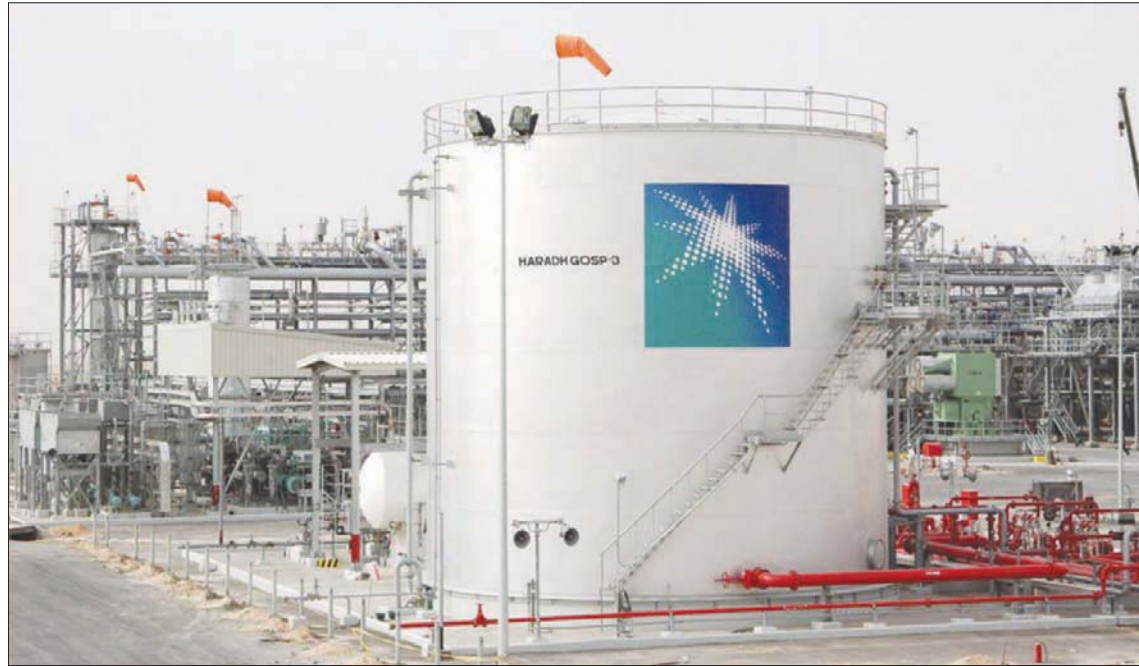
تري «أرامكو» أنه لا توجد مؤشرات حتى الآن على أن ارتفاع الأسعار يقود المستهلكين لتقليص استهلاك المحروقات

لندن: «الشرق الأوسط» أعلنت شركة أرامكو السعودية أن الطلب على النفط يقترب من مستويات ما قبل جائحة كورونا، ووجدت التأكيد على أن المنتجين حول العالم يضحون استثماراتهم أقل بكثير مما يتطلبه مواكبة الطلب.