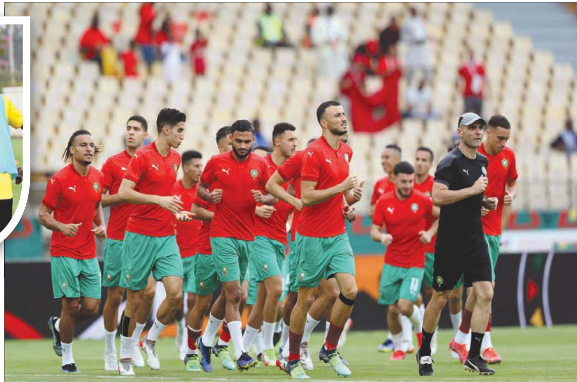
لاعبو المغرب اكتملت صفوفهم واجهزون لمواجهة مالوي

أن التاريخ يرجح كفته في 10 مواجهات أمام مالوي فاز في ست منها مقابل ثلاثة تعادلات مجروحاً من الخروج المخيب من النسخة الماضية في مصر. وقتها أبلى البلاء الحسن في دور المجموعات وأنهاه بالعلامة الكاملة، لكنه مُني بخسارة مدوية أمام بنين التي كانت أحد أفضل أربعة منتخبات في المركز الثالث، 1 - 4 بركلات الترجيح بعد التعادل 1 - 1 في الوقتين الأصلي والإضافي.