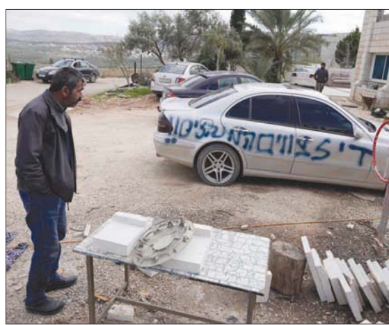
فلسطين قرب سيارته التي استهدفها المستوطنون في سلفيت بالضفة بكتابة عبارات استفزازية عليها

تل أبيب، «الشرق الأوسط» أصدرت قيادة الجيش الإسرائيلي إشعارات بهدم البؤرة الاستيطانية «غفغات رونين»، الواقعة قرب قرية بورين الفلسطينية في الضفة الغربية، وذلك لاستنباها بأن عددا من سكانها قاموا سويما مع متطرفين يهود آخرين، بتنفيذ الاعتداء الدموي على فلسطينيين ونشطاء سلام إسرائيلييين يهود، يوم الجمعة الماضي. وقالت مصادر عسكرية، إن الجيش سيخلي هذه البؤرة في غضون 3 أيام «وفقا لسياسته بإزالة البؤر وسائر المباني غير القانونية في المستوطنات». وأكدت أن هذه البؤر لا تقوم بأداء رسالة طلابية للاستيطان اليهودي كما يدعي قادتها، بل باتت موقعا توتر يسي لسمعة