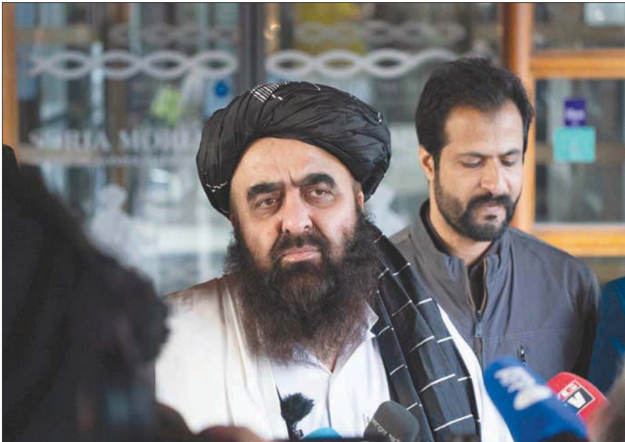
وزير خارجية حكومة «طالبان» يتحدث للصحافيين على هامش اجتماع أوصلو أمس

وذكرت وسائل إعلام نرويجية أن نرويجياً من أصل أفغاني تقدم بشكوى إلى الشرطة في أوصلو أنهم فيها حقاني بارتكاب جرائم حرب. وقال زاهر أناري لشبكة البث العامة (إن إتش كي) إن «الأمر مؤلم. كان أندريس بريينغ بريفيك (النرويجي اليميني المتطرف الذي قتل 77 شخصاً في 2011) قدم إلى البلاد» ضمن وفد.