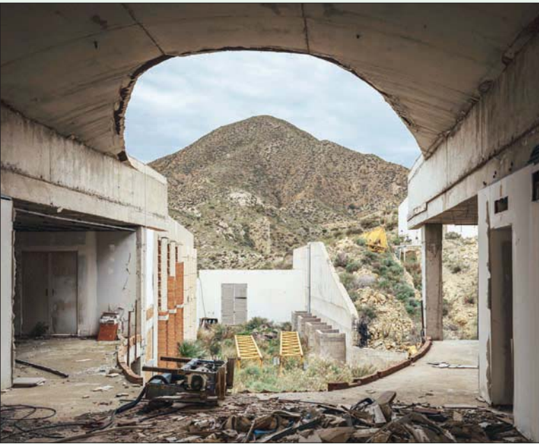
هنا كان من المفروض أن يكون بهو فندق الغارويبيكو

مستوطنات سابقة مرتبطة بمجال التعدين. وعندما سُئِلَ المنتزه، أعادت بلدية جزء من المنطقة المحمية باعتبارها أرضاً صالحة للتطوير العقاري» في إسبانيا، التي حصلت بعد ذلك على تصريح لبناء فندق على شاطئ البحر عام 2003، بينما المباني الأخرى الوحيدة المجاورة، فهي منازل خاصة بُنيت قبل إنشاء المنتزه، وبحجة بناء الفندق، دفع النشطاء المعنيين بالبيئة اللجوء إلى القضاء، وحصلوا على حكم قضائي يقضي بتجميد المشروع عام 2006، في وقت كان بناء الفندق بمرحلة الأخيرة.