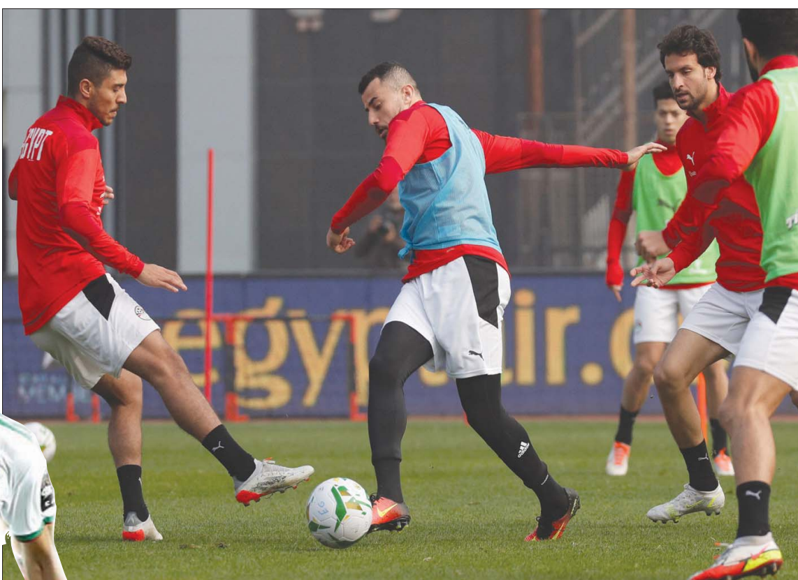
لاعب منتخب مصر خلال التدريبات قبل مواجهة نيجيريا

قال النني في فيديو عبر حسابه الشخصي في فيسبوك: «هذا الجيل وصل للأولمبياد في البداية للمرة الأولى منذ 20 عاماً ثم أمم أفريقيا بعد غياب 3 نسخ وصعدنا للنهائي وأخيراً الوصول لكأس العالم. سعيد بما