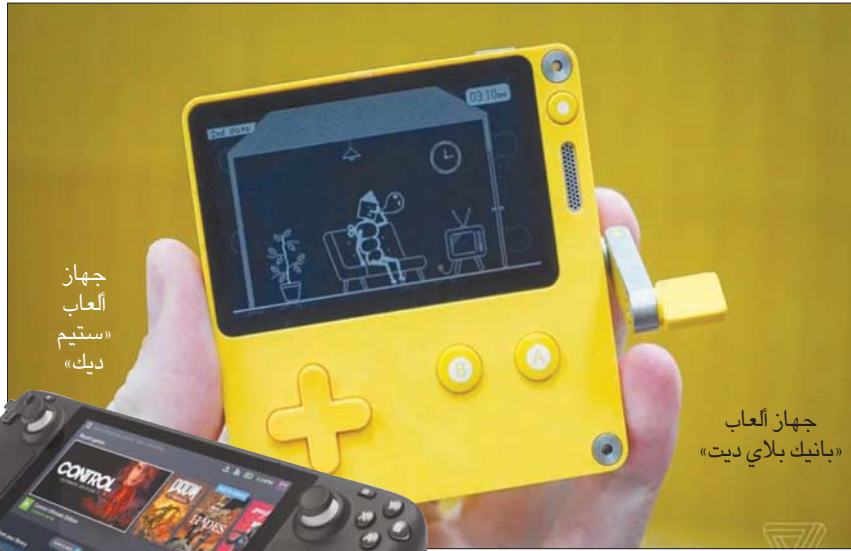
جهاز ألعاب «ستيم ديك»

بمقاس 6,1 بوصة لـ«آيفون 14 برو»، و6,7 بوصة لـ«آيفون 14 ماكس»، و6,7 بوصة لـ«آيفون برو ماكس»، مع تراجع الحفاظ على تصميم «آيفون 13» (خصوصاً الحواف المدنية المسطحة).