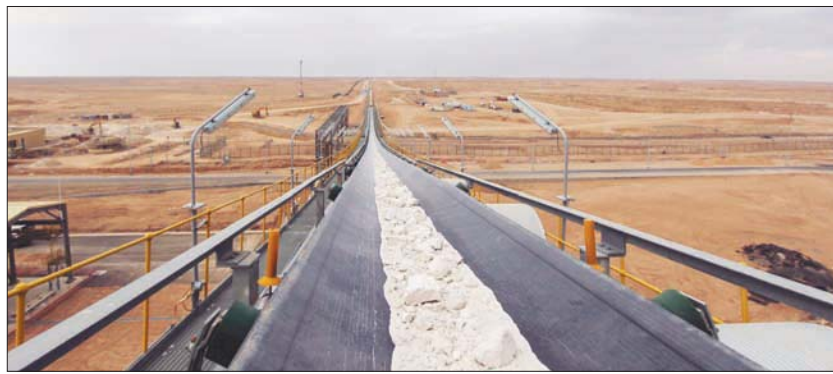
قطاع التعدين واستغلال المحاجر يدفع نمو مؤشر الإنتاج الصناعي في السعودية (الشرق الأوسط)

من العام نفسه، كما تسلط النشرة الضوء على مؤشر استثمار المصانع التي بدأت الإنتاج لتبلغ 72,5 مليار ريال (19 مليار دولار)، بالإضافة إلى عدد التراخيص الجديدة منذ بداية العام السابق حتى نوفمبر بإجمالي 873 ترخيصاً، في حين وصل عدد المصانع التي بدأت الإنتاج في الفترة نفسها والبالغه 731 مصنعاً. وأشارت النشرة إلى مؤشرات نوفمبر التي تضمنت صدور 68 رخصة صناعية، و64 مصنعا بدأ الإنتاج بحجم استثمارات وصلت نحو 1,6 مليار ريال (426 مليون دولار)، في حين يبلغ حجم الاستثمار في المنشآت الجديدة 735 مليون ريال (196 مليون دولار) في نوفمبر 2021. كما تضمنت النشرة قائمة