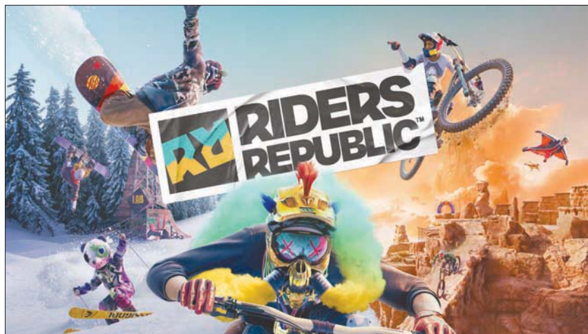
مجموعة من الرياضات الخطرة في لعبة «رايدرز ريبابليك»

الجدير ذكره أن الشعور متقارب بين أنواع السباقات المذكورة، حيث أن ركوب الدراجات يقدم شعوراً بالحساس والمتعة يشابه التزلج على الجليد، وبالتالي سيشعر اللاعب أن الانتقال بين أنواع الرياضات المختلفة هو أمر سواء لمحبي أداء الحركات الخطرة أم التنافس مع الأصدقاء والغرباء، ومحبي الرياضات السريعة أو الذين يبحثون عن الحرية في اللعب.