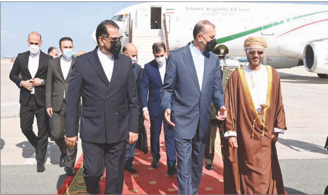
بدر بن حمد البوسعيدي وزير الخارجية العماني لدى استقباله في مسقط وزير الخارجية الإيراني حسين أمير عبدالهيان

والتحقى فهد بن محمود آل سعيد، نائب رئيس الوزراء لشؤون مجلس الوزراء العماني، وزير الخارجية الإيراني. وقالت وكالة الأنباء العمانية، إن السلطان هيثم بن طارق تلقى تحيات الرئيس الإيراني إبراهيم رئيسي خلال استقبال نائب الوزراء لوزير الخارجية الإيراني. وأضاف: «إننا لم نتحقق كل هذا، فإن إسرائيل ملزمة بإعداد خطة درج تشمل خياراً عسكرياً فعلاً من أجل تحقيق أهداف وغايات إنسانيل. وإسرائيل الحق بالدفاع عن نفسها بقواها الذاتية، وتابع: «مهمتنا في اللجنة هي التحقن والإشراف على أن هيئات جهاز الأمن تعمل من أجل تحقيق رؤية الحكومة وتخرج تعليمات الحكومة الأمنية المغفرة إلى حيز التنفيذ من ناحية بناء القوة وخطط العمل متعددة السنوات كي تكون مستعدين وجاهزين لمواجهة كل التحديات، من السكن حتى النووي.»