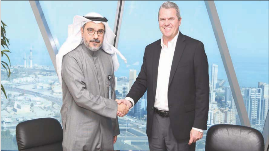
جانب من توقيع مذكرة التفاهم بين شركة «الكويتية لنفط الخليج» و«شيفرون» السعودية أمس

وارتفعت أسعار النفط 5 في المائة الأسبوع الماضي بعد أن عطلت الاحتجاجات في كازاخستان خطوط القطارات، وأضرت بالإنتاج في تغيزن أكبر حقول النفط في البلاد، وبينما أدت صيانة خط أنابيب في ليبيا إلى خفض الإنتاج من 1,3 مليون برميل يومياً العام الماضي إلى 729 ألف برميل يومياً.