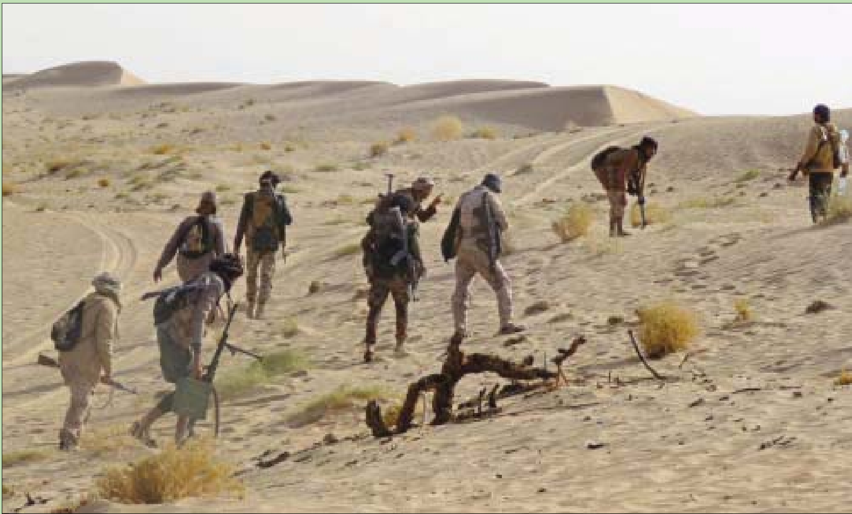
عناصر من قوات مؤيدة للحكومة اليمنية يأخذون مواقعهم أثناء مواجهة مع الحوثيين جنوب مأرب (أ.ف.ب)