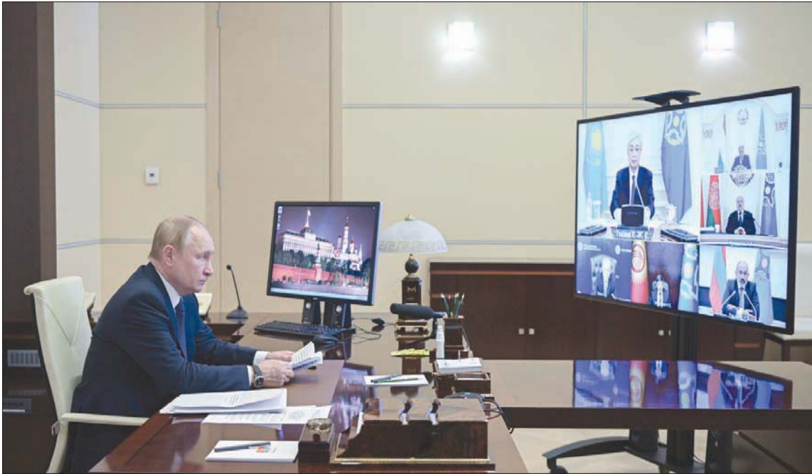
بوتين خلال القمة الافتراضية مع قادة منظمة الأمن الجماعي أمس

في الهجمات مواطنون كازاخيون وأجانب، على حد سواء».