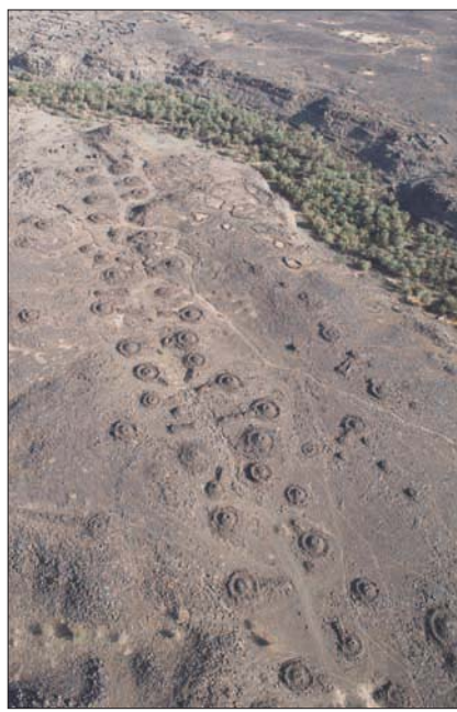
ممر يؤدي إلى خارج واحة خيبر

وستفتح المؤسسة الرائدة والتي تعمل الآن كمخضبة بحثية، أبوابها للجمهور كمشاهدة سياحية دائمة في العلا بحلول العام 2030. وسيفتح المؤسسة الرائدة والتي تعمل الآن كمخضبة بحثية، أبوابها للجمهور كمشاهدة سياحية دائمة في العلا بحلول العام 2030.