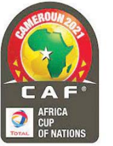
ياوندي، الشرق الأوسط.