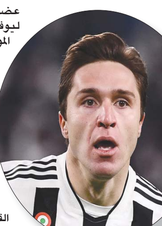
كيزرا أصيب بقطع في الرباط الصليبي

عضلية بفحذه، وقد سجل ليوفنتوس أربعة أهداف هذا الموسم في مختلف المسابقات. وكتب يوفنتوس في بيان على موقعه الرسمي: «خلال المباراة ضد روما تعرض كيزرا لاتواء حاد في ركبته اليسرى. أظهرت الفحوص التي أجريت له قطعاً في الرباط الصليبي الأمامي. سيكون من الضروري إجراء جراحة في الأيام القليلة المقبلة».