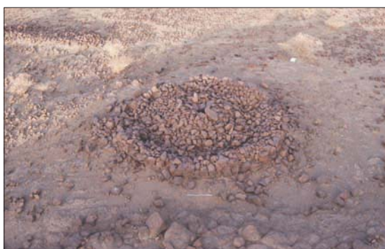
حلقات دائرية كثيرة تعود للألفية الثالثة قبل الميلاد من واحة خيبر

وستفتح المؤسسة الرائدة والتي تعمل الآن كمخضبة بحثية، أبوابها للجمهور كمشاهدة سياحية دائمة في العلا بحلول العام 2030. وسيفتح المؤسسة الرائدة والتي تعمل الآن كمخضبة بحثية، أبوابها للجمهور كمشاهدة سياحية دائمة في العلا بحلول العام 2030.