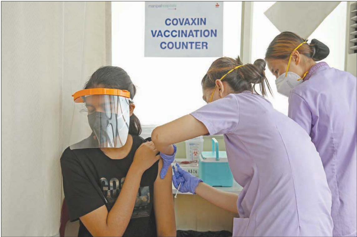
جانب من حملة التطعيم في مدينة بنغالور الهندية

عن الآخر، والتركيز على المتحور الجديد من شأنه أن يؤدي لإعادة تنشيط منحور (دلتا) الذي هو الأكثر خطورة من المتحورات التي طرأت على فيروس (كورونا) المستجد حتى الآن. وتجدر الإشارة إلى أن تحديد المتحور الذي تنشأ عنه الإصابة يتم عن طريق التسلسل الوراثي للفيروس، وهي تقنية متطورة تطبقها الدول الأوروبية بنسبة متدنية جداً، مقارنة بتطور الجائحة «حيث إننا نتحرك في ظلام، ونستخدم الأسلحة نفسها ضد أهداف مختلفة جداً بعضها