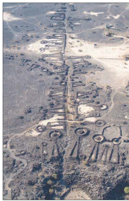
ممر يؤدي إلى خارج واحة العين قرب خيبر في شمال غربي السعودية

واستخدم فريق جامعة غرب أستراليا في أحدث أبحاثه التي ترأسها الدكتور ماثيو دالتون كباحث رئيسي، تقنية تحليل صور الأقمار الصناعية والتصوير الجوي والمسح الأرضي والتقنيات لتحديد وتحليل الممرات الجائزية عبر مساحة لا تقل عن 160 ألف كيلومتر مربع في شمال غربي شبه الجزيرة العربية. وقد سجل الفريق أكثر من 17,800 مدفن حجري على شكل قلاذة ضمن مناطق دراستهم الأولى في محافظتي العلا وخبير، حيث يُشكل نحو 11,000 منها جزءاً من الممرات الجائزية.