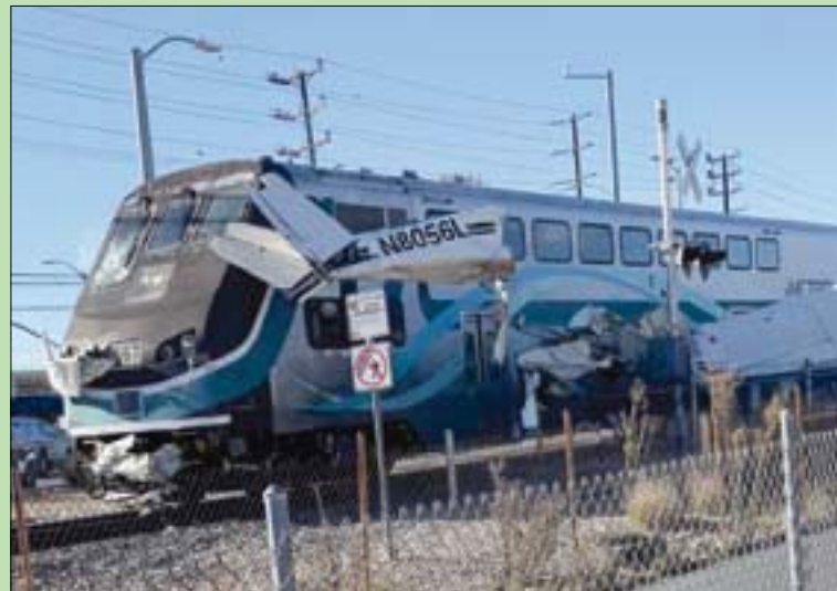
قطار يصدم طائرة سقطت على خط للسكك الحديدية في كاليفورنيا (رويترز)