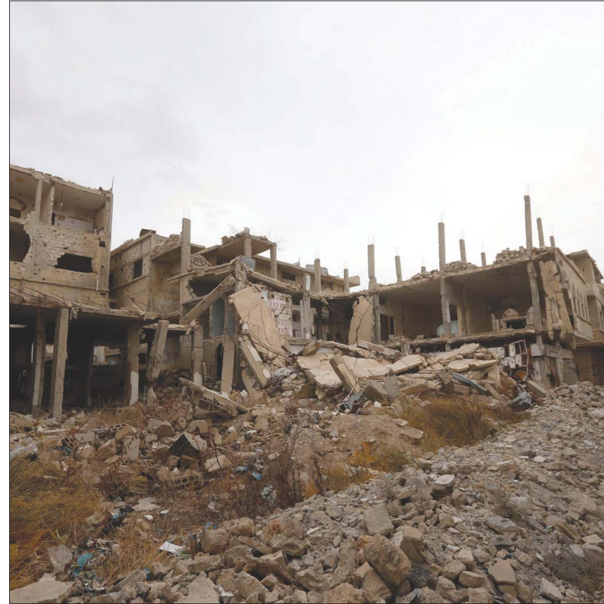
أبنية مهتمة في مدينة القريتين التي سيطر عليها تنظيم «داعش» عام 2015 على تخوم البادية السورية بمحافظة حمص

من فوله للتمركز من جديد برغم كل الخسائر في صفوف قياداته، فضلاً عن الخسائر المادية الضخمة التي كان يعتمد عليها، والتي قدرت بملايين الدولارات. ونبه «المرصد» إلى «مخاطر استهداف التنظيم للمدنيين ومنازلهم، خصوصاً الأطفال وخطف النساء مقابل الفدية»، مؤكداً «مساندته للأهالي في المناطق غير الآمنة» التي تنتشر فيها خلايا «داعش».