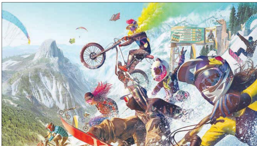
استمتع بتجارب السترات الفائقة والدراجات الهوائية في البيئة الوعرة بصحبة المنحدرات الثلجية

الجدير ذكره أن الشعور متقارب بين أنواع السباقات المذكورة، حيث أن ركوب الدراجات يقدم شعوراً بالحساس والمتعة يشابه التزلج على الجليد، وبالتالي سيشعر اللاعب أن الانتقال بين أنواع الرياضات المختلفة هو أمر سواء لمحبي أداء الحركات الخطرة أم التنافس مع الأصدقاء والغرباء، ومحبي الرياضات السريعة أو الذين يبحثون عن الحرية في اللعب.