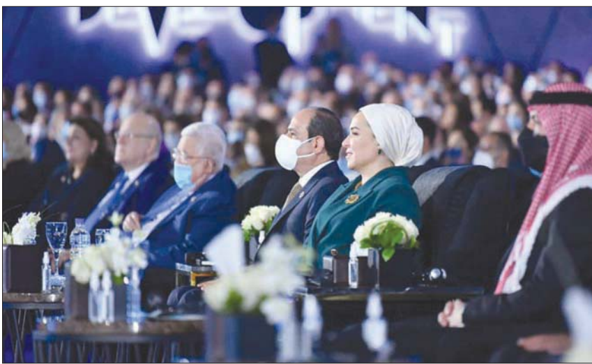
السياسي وقرينته والرئيس عباس وميقاتي وولي عهد الأردن خلال حفل افتتاح النسخة الرابعة من منتدى شباب العالم أمس

الأول من المنتدى، إذ دعا رئيس منظمة الصحة العالمية تيدروس أدهانوم جيريسوس، في كلمة له عبر تقنية «الفيديو كونفرانس» لافتة داخل قاعة المؤتمرات لوصفها مصر بأنها «قلب لكل العرب»، معتبرة إياها «وطنها الشائسي الذي تتحرك تجاهه