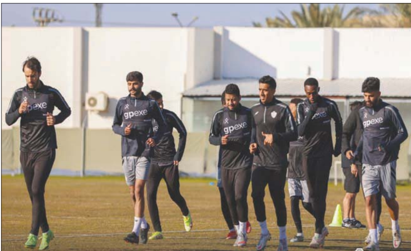
جانب من تدريبات الطائي التحضيرية لمواجهة الهلال

أما فريق الفيصلي، فيسعى إلى تجاوز أخطاها الأخيرة التي لازمتها في عدد من المباريات، رغم تقديمه أداءً فنياً مميزاً، حيث خسر عنابي سدير في ثلاث مباريات متتالية كانت أمام الاتفاق والطائي ثم الهلال في الجولة الماضية، بالإضافة لخسارته لكاس السوبر السعودية. ويفتقد الفيصلي في مواجهته هذا المساء لخدمات مهاجمه تافاريس بسبب مشاركته مع منتخب بلاده في كأس أمم أفريقيا 2021، وذلك بعدما شارك في مباراة السوبر الأخيرة، وغادر للانضمام لمنتخب بلاده، حيث يعد غيابه مؤثراً عن صفوف الفريق لما يمثله من قوة فنية.