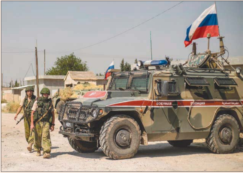
جنود روس في سوريا

لهم وضمانات بعدم الملاحقة الأمنية، في إطار الحرب الباردة بين الروس والإيرانيين في سوريا. وكان «المرصد» قد ذكر في تقرير آخر أول من أمس إلى أن «القوات الروسية تعمل على مزامنة الإيرانيين في مناطق نفوذ النظام ضمن محافظة اللاذقية، عبر كسب ود الأهالي لاستقطاب عناصر الدفاع الوطني إلى الجناح الروسي بدلاً من الجناح الإيراني». وفي هذا السياق، أفاد «المرصد» بأن القوات الروسية قامت صباح السبت بجولة ضمن قرية حامو الواقعة بريف القامشلي الشرقي ضمن محافظة الحسكة، والخاضعة لسيطرة قوات النظام وقوات الدفاع الوطني، وعمد الروس إلى توزيع أدوية وطحن وخبز على أهالي القرية وسكانها.