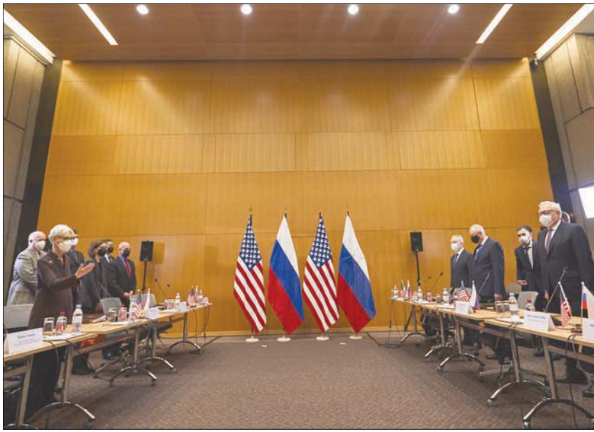
الجانباين الأميركي والروسي لدى بدء الحوار الاستراتيجي بينهما في جنيف أمس

في الناتو، يجعلها في موقف غير مريح لإجراء حوار ثنائي». ومع ذلك، رأى خبراء روس أن انعقاد المحادثات الحالية يعد خطوة متقدمة في حد ذاتها، وقد تساعد في تخفيف التوتر بأوروبا. ووفقاً لتعليقات، فإن موسكو تطالب الغرب بالتزامات موثقة قانونياً بعدم توسيع الناتو شرقاً، وبسبب أنها لن تقبل التزامات شفهية». ولم يستبعد خبراء احتمال التقدم في بعض جوانب المحادثات، خصوصاً حول منع نشر الأسلحة النووية خارج الأراضي الوطنية لكل طرف، مع الإشارة إلى احتمال أن يتوصل الجانبان إلى تفاهم حول توقيع نسخة جديدة من اتفاقية الصواريخ قصيرة ومتوسطة المدى التي انسحب منها الطرفان سابقاً. في المقابل، تبدو التوقعات