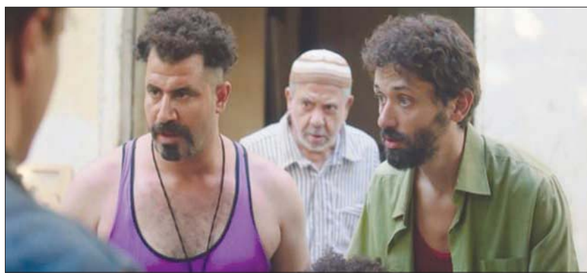
لقطة «من أجل زيكو»

فوق التلفزيون، فيكون قراره الذي لن ينفذه، بمجرد عودتنا إلى القاهرة ستصكك ورقة طلاقاً! وفي مشهد أقرب إلى الفنتازيا، لتتلقي العائلة بغبطة تم ضربها بـ«ساطر»»، ولا تزال تلك الأداة الحادة العنيفة عالققة برأسها. فيقتربون منها في توجس، فستحفظ فجأة وتغتنف الزوجة يرال برأسها لتقوم بتعنيف الزوجة التي استخدمت كلمة «ولية»، وهي تتحدث عن الفتاة التي تشير في الأدبيات الشعبية إلى سيدة كبيرة سناً، متواضعة اجتماعياً!