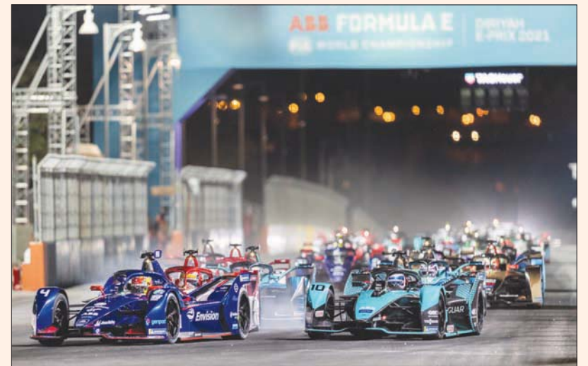
نجوم العالم في الـ«فورمولا إي» سيكثرون حاضرين في سباق الدرعية (الشرق الأوسط)