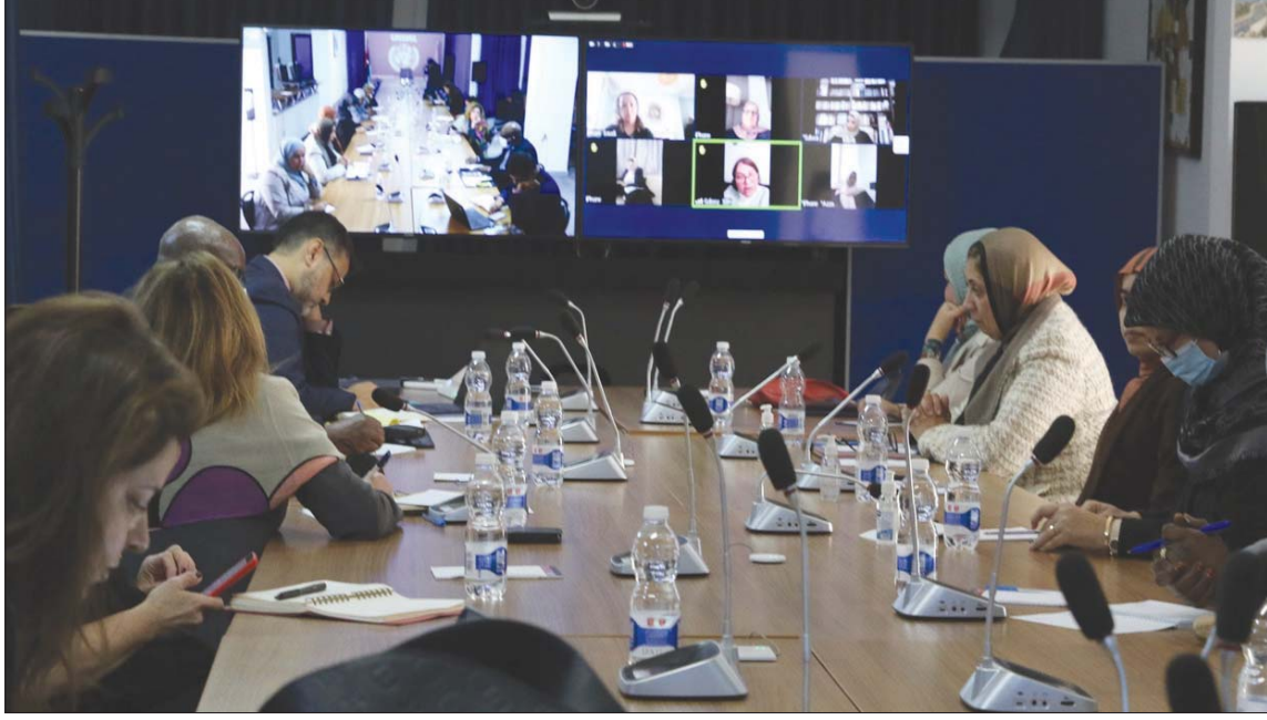
ستيفاني ويليامز لدى اجتماعها مع الكتلة النسائية بـ«ملتقى الحوار السياسي الليبي»

شدت ستيفاني ويليامز، مستشارة الأمين العام للأمم المتحدة للشأن الليبي، مجدداً على «ضرورة احترام إرادة الناخبين»، ومعالجة ما وصفته بـ«أزمة الشرعية»، التي تواجه المؤسسات الرسمية في البلاد. وفي غضون ذلك، يستعد عقيلة صالح، رئيس مجلس النواب، لاستئناف مهام منصبه بعد انقطاع سبب الانتخابات الرئاسية الموقلة.