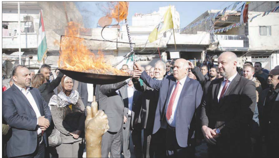
وفد اللجنة المركزية لحركة «فتح» في مخيم اليرموك بدمشق مشاركاً في إحياء ذكرى انطلاق الثورة الفلسطينية

دمشق: «الشرق الأوسط» كشف أمين اللجنة المركزية لحركة «فتح» اللواء جبريل الرجوب، عن «زيارة قريبة للرئيس الفلسطيني محمود عباس إلى سوريا». وقال الرجوب في مؤتمر صحفي عقده في فندق الشام وسط العاصمة دمشق، إن وفد القيادة في دمشق على الرسالة الخطية التي أرسلها الرئيس محمود عباس إلى الرئيس بشار الأسد، تضمن تشجيع ومباركة كل الجهود التي تقوم بها حركة «فتح» ومنظمة التحرير الفلسطينية» برئاسة الرئيس عباس للملمة الواقع الفلسطيني، وإنجاز «وحدة فلسطينية» تؤمن كل ما من شأنه «حماية منجزاتنا وإعادة الاعتبار لمنظمة التحرير وتفعيلها وتكريسها كمثل شرعي ووحيد للشعب الفلسطيني». وأضاف «نقدر المغزى والدلالات لرسالة التشجيع التي سمعناها من القيادة السورية».