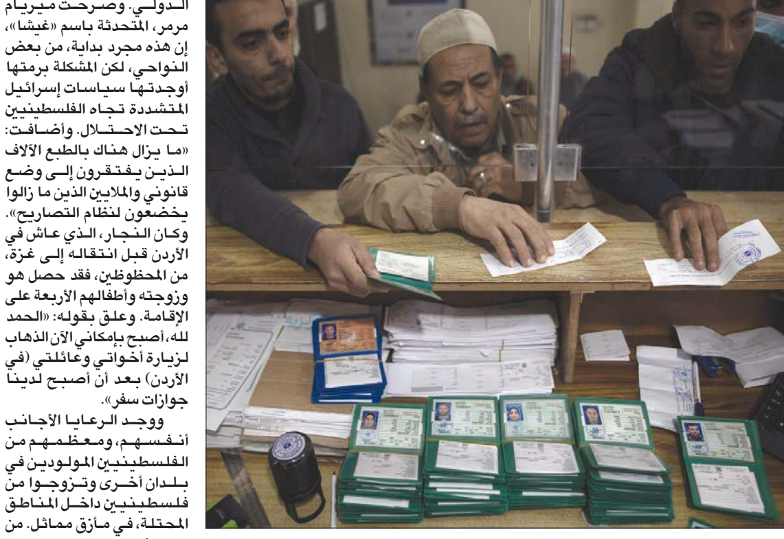
فلسطينيون ينتظرون تسلم هوياتهم من مكتب الشؤون المدنية في غزة الأربعاء الماضي