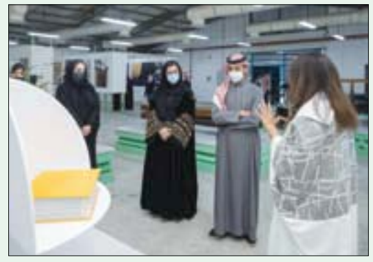
جانب من المهرجان السعودي للتصميم (الشرق الأوسط) الرياض: عمر البديوي

أطلق المهرجان السعودي للتصميم فعالياته، وفتح أبوابه للجمهور والزوار، لاكتشاف مساحة فنية وإبداعية تجمع المهتمين بالتعلم والاستكشاف والإحتفاء بما يخص التصميم، وإعادة تصور المستقبل، والتواصل لخلق مساحة خاصة بالسعودية لتكون جزءاً من الثقافة العالمية والخريطة الإبداعية، وخلق منصة ترضي الحوار، وتزود المواهب المحلية بالفرص، وتعزز المساهمة في التنمية الاجتماعية والوطنية.