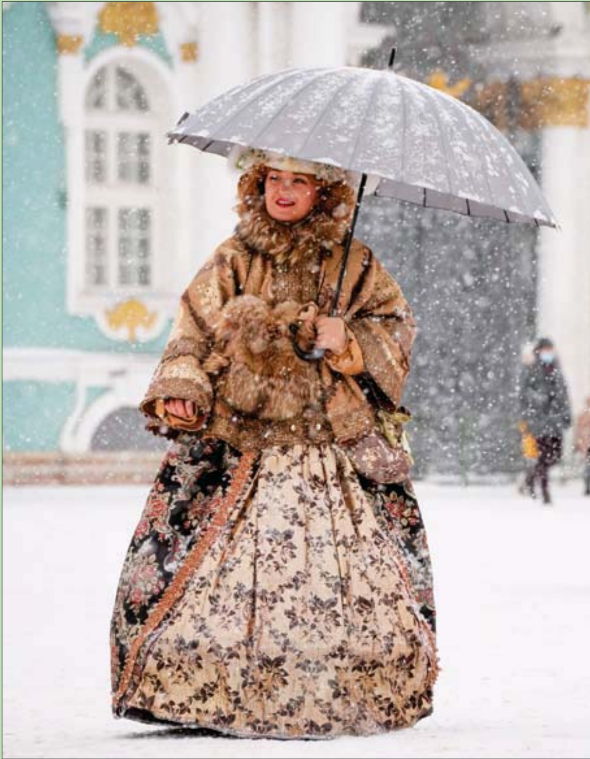
ممتلئة روسية ترتدي ملابس من القرن الثامن عشر تمشي في سانت بطرسبرغ خلال تساقط للثلوج

وهذه (الشغلانة) تلائمني، ولا أستبعد أن أقدم لهذه الوظيفة - إذا الظروف حدثتني - فأحلى ما فيها أنها: (راحة وطراحة)، وبعدها أحلب لبن، ولا ناشدن عنك ولا قائلن من؟!.