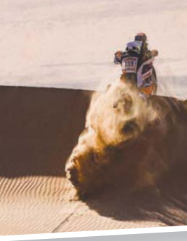
البريطاني سام سندرلاند استعاد صدارة سباق الدراجات النارية

وواصل فريق «كاماز» سيطره على فئة الشاحنات، وحقق سائقوه المراكز الأربعة الأولى للمرحلة الثامنة، وحقق الروسي ديمتري ستونيكوف