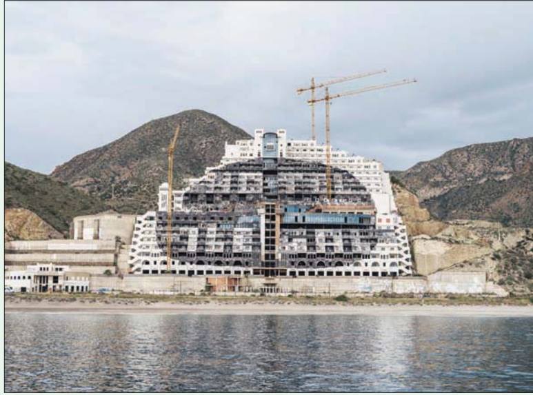
ميكال فندق الغارويبيكو بالقرب من الميريا في إسبانيا