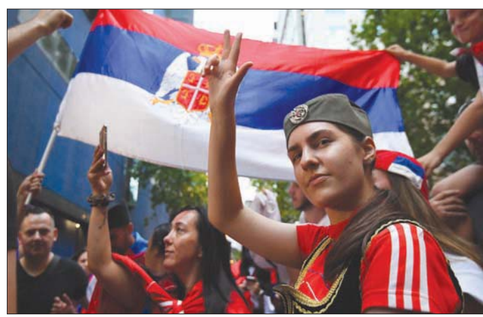
جماعير من الجالية الصربية تحتفل خارج المحكمة بانتصار ديوكوفيتش في قضية

وكانت الحكومة الأسترالية قد ألغت أيضاً تأشيرة اللاعب التشيكية ريناتا فوراكوف بعد حصولها على إعفاء طبي، لتفاد السبب بعدما احتجزت في المركز الذي احتجز به ديوكوفيتش.