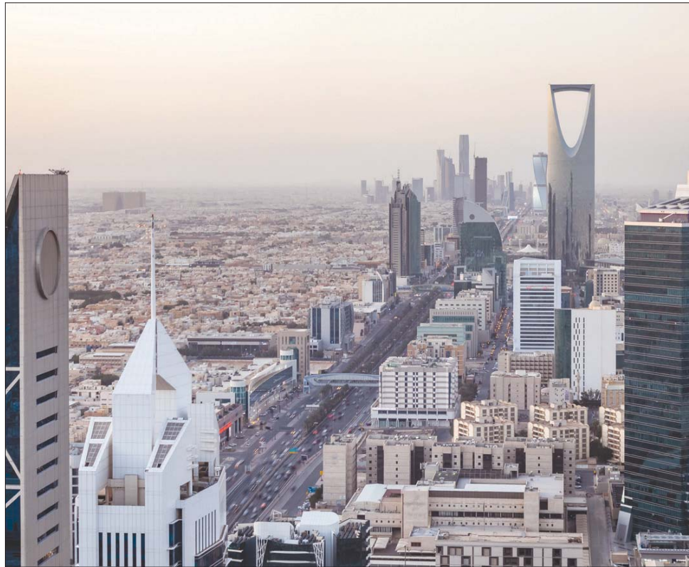
الرياض تستضيف الوزراء العرب لبحث مستقبل التعدين في المنطقة (الشرق الأوسط)

يشهدها قطاع التعدين في الوقت الحاضر، حيث تم وضع الإستدامة في صلب قوانين واشتراطات العمل في هذا القطاع، وفق نظام الاستثمار التعديني الجديد، الذي تمت صياغته وفق أفضل الممارسات الدولية، حيث يقدم التزامات واضحة فيما يتعلق بكيفية إدارة المناجم، والحفاظ على صحة الأشخاص الذين يعملون ويعيشون حول مشاريع التعدين، كما يتطلب من المستثمرين تقديم تقارير استدامة سنوية. وشددت المملكة على جميع الدول، أن تتعاون لإنشاء منظومة قانونية متوازنة وشفافة ومستدامة تحقق مصالح كل الأطراف ذوي العلاقة بالمشاريع التعدينية، مع ضرورة أن تؤخذ تقنيات خفض الانبعاثات في الاعتبار، كونها أصبحت من الركائز الرئيسية في صناعة التعدين وتشكل مستقبل القطاع. اتجاه التعدين أعلنت المملكة، في عام 2021 إطلاق مبادرة السعودية الخضراء، والأخذ بزمام الريادة في دفع عجلة مكافحة أزمة المناخ، وتبني خطة تساهم في جعل العالم أكثر اخضراراً، بغية تقليل الانبعاثات من خلال مشاريع الطاقة المتجددة، ومبادرات احتجاز الكربون، ودعم كامل لكفاءة الطاقة في الصناعة، حيث تشير التقديرات إلى أن صناعة التعدين مسؤولة عن 4 إلى 7 في المائة من انبعاثات غازات الاحتباس الحراري على مستوى العالم. وتوقع تقرير مجموعة «ماكينزي» دور شركات التعدين في إزالة الكربون، منوهاً أن نمواً كبيراً سيحدث في التقنيات منخفضة الكربون في حال التزمّت الصناعات بخفض الانبعاثات بما يتماشى مع أهداف اتفاقية باريس، فيما سيؤدي نمو الصناعة إلى تغيير أنماط الطلب على سلع التعدين الأولية. وتشمل التقنيات التي تدعم إزالة الكربون توربينات الرياح، والخلايا الكهروضوئية الشمسية، والمركبات الكهربائية، وتخزين الطاقة، وإعادة تدوير المعادن، وخلايا وقود الهيدروجين، واحتجاز الكربون