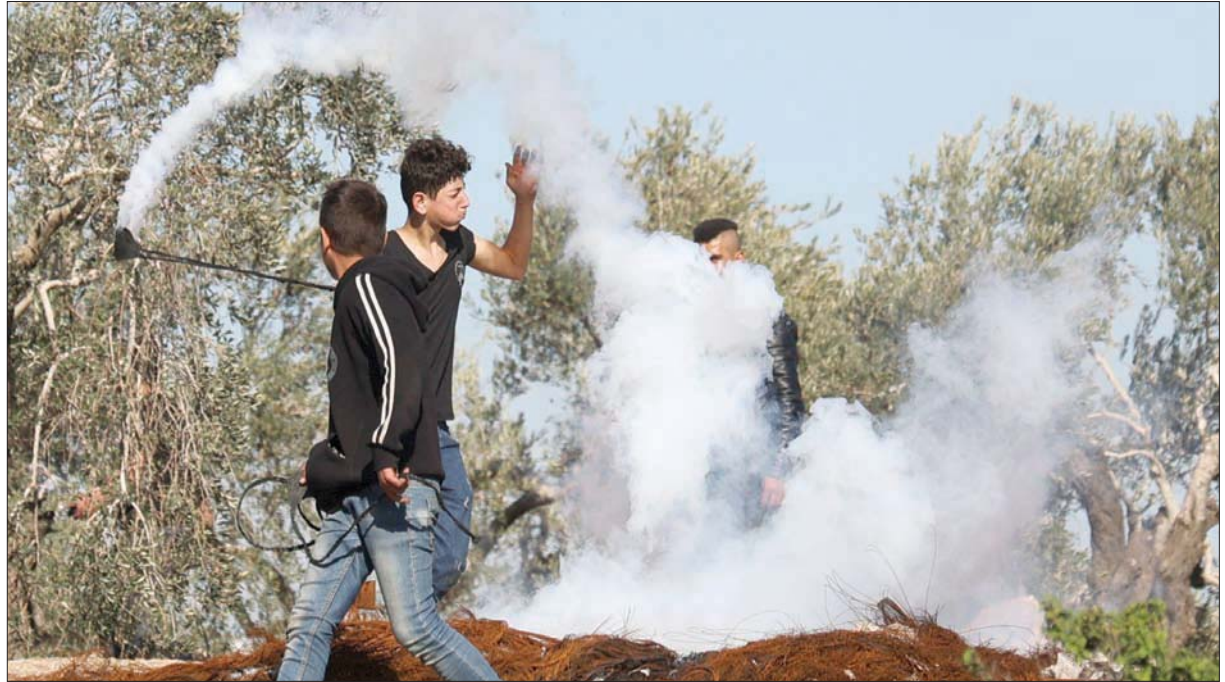
متظاهرون فلسطينيون يعيدون عبوة غاز مسيل للدموع خلال اشتباكات مع قوات إسرائيلية في قرية بيتا بالضفة أمس

وأصيب 12 فلسطينيا بالرصاص المعدني المغلف بالمطاط، و20 بالاختناق بالغاز المسيل