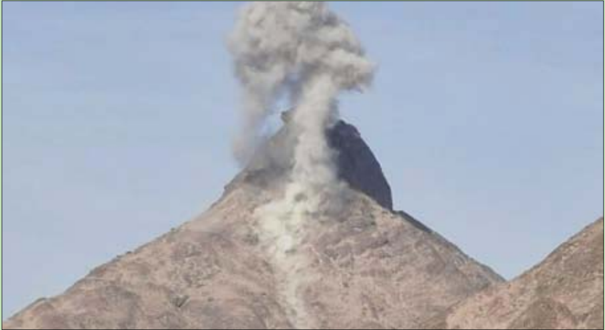
صورة متداولة على وسائل التواصل الاجتماعي تظهر جانباً من ضربات التحالف لمواقع حوثية

الأول يمر وادي خير وهو الذي سلكته الميليشيات للفرار، حيث يؤدي إلى عقبة القذخ أولى مناطق مديرية نعمان، في حين يربطها الطريق الأخر بمديرية ناطع.