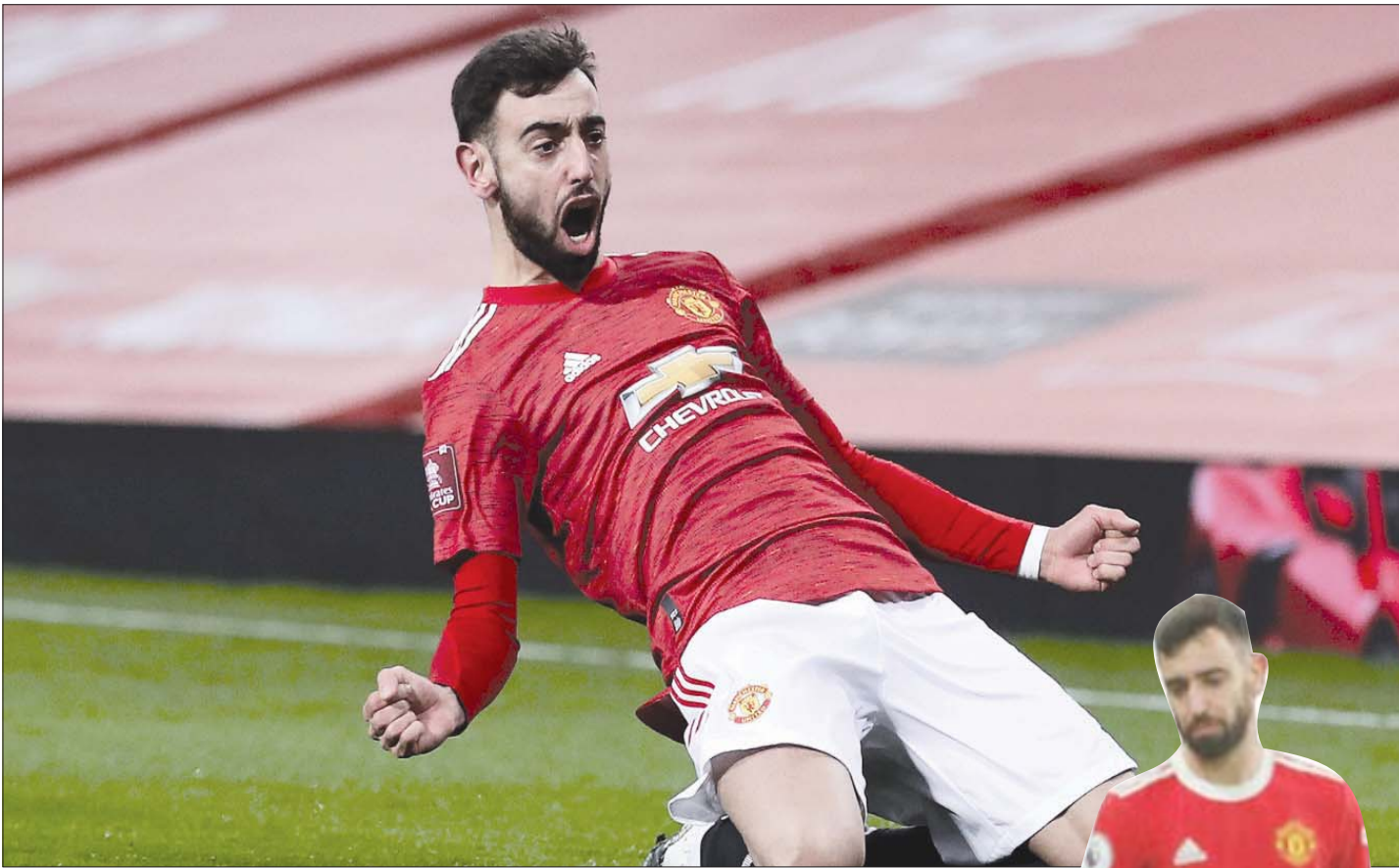
أصبح هناك لاعب واحد فقط يمكن تغيير طريقة اللعب من أجله وهو رونالدو وليس فرنانديز

بالإضافة إلى ذلك، كان برونو فرنانديز أحد النقاط المضيئة القليلة في مانشستر يونايتد في أحلك وأصعب الأوقات، ومن دونه كان الممكن أن تنجح الأمور من طريق كارثية. لقد ذهبت لمشاركة عدد قليل من المباريات خلال تلك الفترة، وكنت دائماً ممتناً لرؤية فرنانديز، الذي كان ولا يزال أحد أهم لاعبي مانشستر يونايتد وأحد الحلول المهمة إذا كان النادي يرغب في العودة إلى المسار الصحيح.