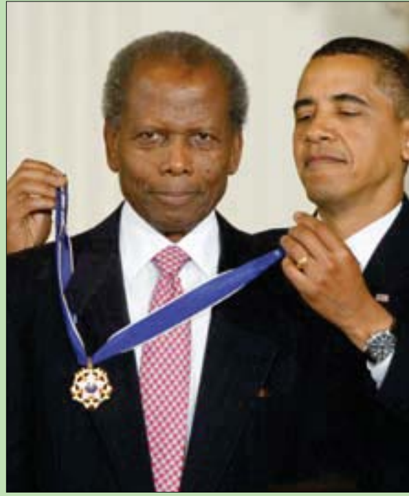
الرئيس الأسبق باراك أوباما يسلم بواتييه وسام الحرية خلال حفل في البيت الأبيض عام 2009

جائزة أوسكار فكتبت أن بواتييه، وبفضل «عنفوانه وطبيعته وقوته وتميزه وطاقته الخالصة... علمنا أننا نحن السود مهمون»، في استعارة لاسم حركة «بلاك لايفز ماتر» (حياة السود مهمة) المناهضة للعنصرية ضد السود.