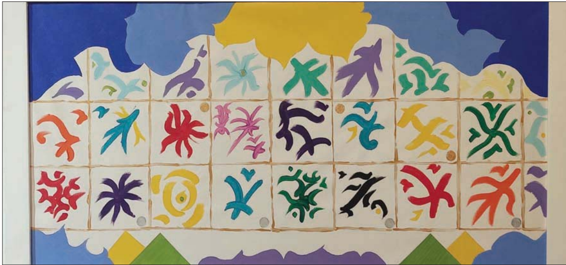
من أعمال الطاهر بن جلون