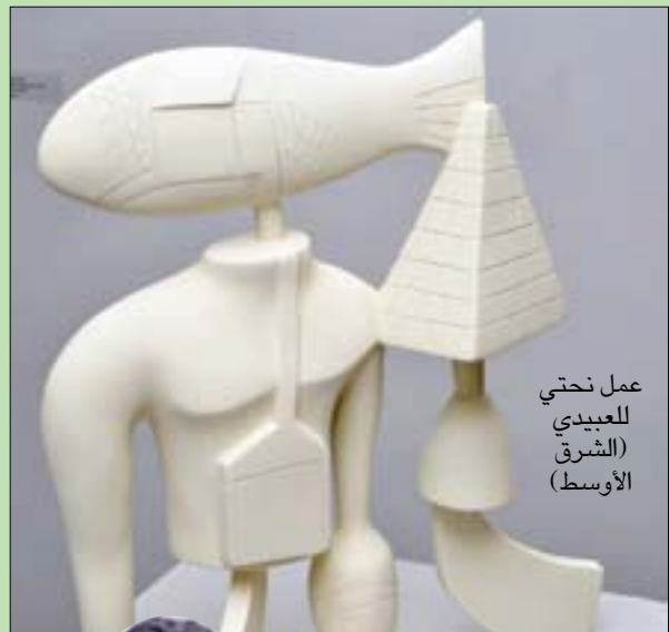
عمل نحتي للعبيدي

يقول العبيدي، لـ «الشرق الأوسط»: «لا أستطيع تجاهل توثيق العلاقة مع وطني الذي أنتمي إليه، ولا أملك حالة من الحيادية الكريهة تجاه من يتخلون عن الوطن باسم الديمقراطية متجاهلين ما لحق به من دمار ونهب وتشويه». إمعاناً في إبراز المعنى يأخذ العبيدي الملتقى إلى العوالم البدائية فربما يجد فيها ما لا للتعبير بصدق وعفوية عمَّا أصاب الواقع من فوضى وتفكك، مصوراً مدعي «الثقافة والوطنية والعملة الكاذبة» كأنها أجزاء جسد مبعثرة هنا وهناك بلا هدف حقيقي سوى مصالحهم الشخصية، وهي في الوقت ذاته تعتر عفا تركه المحتل من دمار وسلب لاستقرار المجتمع وامانه وترائه: ذلك أن فكرة التواصل من خلال الرسوم البدائية في حد ذاتها هي دلالة محفزة على دراسة المشهد وتحليله لا سيما عند التركيز على عنصر الإنسان الذي تم التصرف في نسب جسده بجرأة ليظهر كما لو أنه بقايا مدمرة من إنسان غير مشذب، أو كما لو أنه نوع من الكائنات الأسطورية المتخلطة، وهو في أثناء ذلك يمزج بين الواقعية والسريرية والرمزية ويضخ سيالاً من الخطوط العنيفة والإشارات والدوائر والعلامات