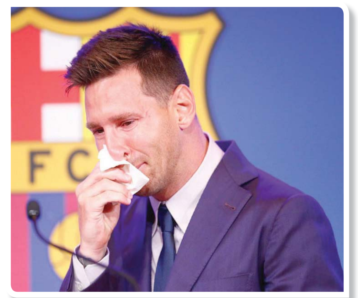
الثامن من أغسطس شهد زلزالاً كروياً برحيل ميسي عن برشلونة في مشهد لم يكن يتوقعه أحد

الآن، ونحن نبحت عن أفضل حل». وفي الثالث من يوليو، تناول لاورنا وجبة الغداء مع رئيس رابطة الدوري الإسباني الممتاز، خافيير تيباس، وغادر معتقداً بأنه سيتم العثور على صفقة مناسبة تمكن النادي من الاحتفاظ بلاعبه الغد. وبحلول منتصف يوليو، علم برشلونة بإمكانية الوصول إلى حل؛ لكنه لم يعلن عن ذلك. لقد اعترف لاورنا في وقت لاحق بأنه كان يعتقد أن ميسي قد ينضم جميعاً في اللحظة الأخيرة، وحتى قبل ظهور ميسي الوداعي، كان من الممكن تصديق ذلك بطريقة ما. لكن عندما ظهر ميسي، كانت الدموع بعيثه، وسط تلميحات بالالتزامات. لكن الشيء اللافت للنظر هو السرعة التي يتحرك بها الناس، فحتى هتافات «ميسي» التي ردها الجمهور في الدقيقة العاشرة، لم تستمر حتى في الشوط الثاني من المباراة الافتتاحية في الموسم؛ وذهب المقيص رقم 10 إلى أسوأ فاتي بشكل عادي، وخال من الضجة؛ وحتى الالفتات الاحتجاجية على رحيله لم تظهر إلا ليوم واحد فقط، واختفت بعد ذلك. ومع ذلك، هناك تذكيرات دورية مؤلمة بفداحة الخسارة التي تكبدها النادي، برحيل أعظم لاعب في تاريخه، وما حدث بالفعل يجب أن يجعل لاورنا يطرح على نفسه هذه الأسئلة: هل تم القيام بما يكفي حقاً؟ وهل كان بالإمكان تفادي رحيل ميسي؟ وهل كان الأمر يتعلق بالمال فقط؟ وما هو الدور الذي لعبه ريال مدريد ومشروع الدوري الإسباني الممتاز في كل هذا؟ وما هو الدور الذي لعبته رابطة الدوري