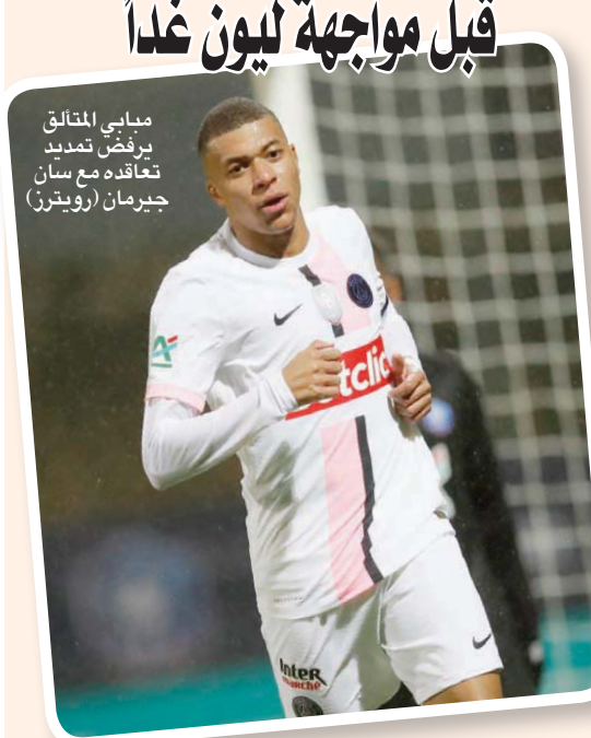
مبابي المتعلق برفض تعاقده مع سان جيرمان

باريس، «الشرق الأوسط» يستأنف باريس سان جيرمان، متصدراً الترتيب، مشوار استعادة اللقب في الدوري الفرنسي لكرة القدم من ليل، عندما يحل غداً ضيفاً على ليون المتعثر ضمن المرحلة العشرين والأولى بعد نهاية العطلة الشتوية.