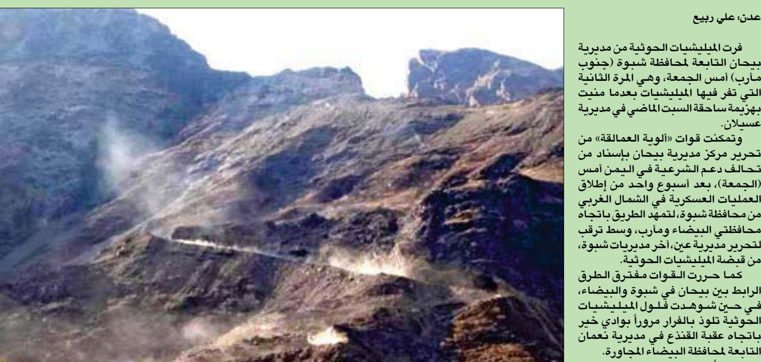
صور تداولها ناشطون يمنيون لأغبرة ناجمة عن هروب عناصر حوثية من بيحان صوب محافظة البيضاء أمس