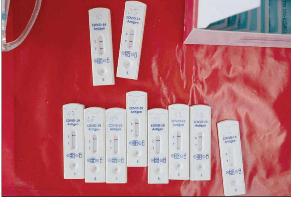
مركز فحص يستعرض نتائج اختبار «كورونا» السريع في ليما عاصمة بيرو

مراجعتها من باحثين خارجيين. ورغم صغر حجم هذه الدراسة، فإن نتائجها متسقة بشكل ملحوظ، ولم يكشف اختبار مستضد سريع واحد عن الفيروس إلا بعد يومين تقريباً من الإصابة الأولية. وبالإضافة إلى ذلك، فإن حالات الإصابة من الأشخاص الذين تلقوا نتائج سلبية كاذبة يمكن أن تدق أجراس الإنذار.