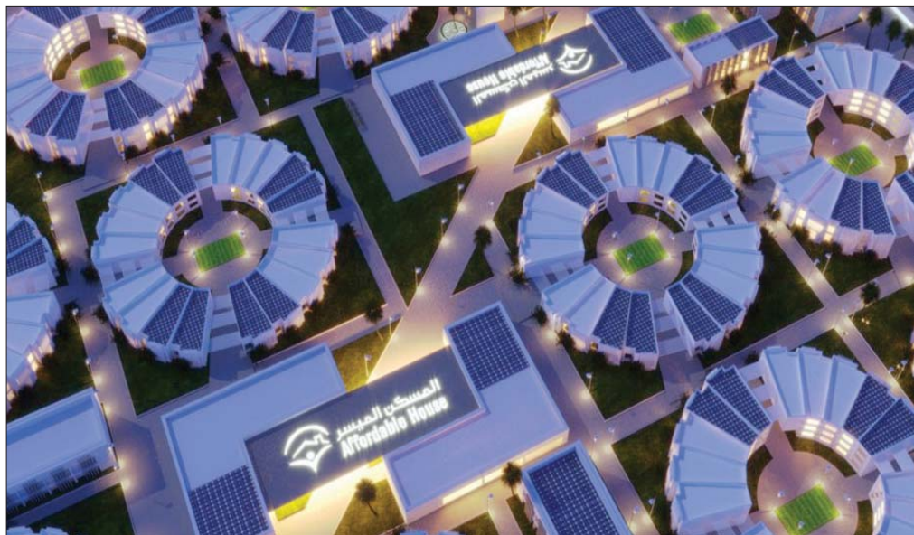
تطوير أول مجمع سكني صديق للبيئة في مدينة «سبارك» شرق السعودية (الشرق الأوسط)

وافقت مدينة الملك سلمان للطاقة (سبارك)، المنظمة العالمية المتكاملة في مجال توطئة صناعات وخدمات الطاقة في السعودية، عن توقع اتفاقية لتطوير مجمع سبارك السكني وفق أحدث التصاميم والمعايير العالمية، ليكون أول مجمع سكني أخضر مستدام في البلاد. وحسب الإعلان أمس، ستقوى المشروع شركة المسكن الميسر السعودية، التابعة لمجموعة عبد الله بن سعيدان وأولاده العقارية، باستثمار يبلغ 375 مليون ريال (100 مليون دولار)، حيث يتماشى تصميم المجمع السكني، الذي يقع شرق السعودية، مع المبادرات الخضراء التي تبنتها المملكة في رؤية 2030. إن ستردمج التقنيات الخضراء مع أحدث معايير الاستدامة، مع توفير وسائل