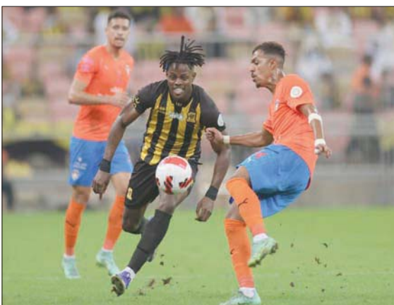
كما را في هجمة اتحادية وسط مضايقة لاعبي الفيحاء

الدنهاء النقطة الثامنة عشرة مقابل خمس عشرة نقطة لفريق الباطن الذي تراجع في لائحة الترتيب نحو المركز «قبل الأخير»، ويسعى فريق الشباب إلى مواصلة منافسته على صدارة الترتيب عندما يستضيف أبها اليوم على ملعب الأمير فيصل بن فهد في مباراة يبحث فيها عن رد اعتباره بعد خسارة الدور الأول