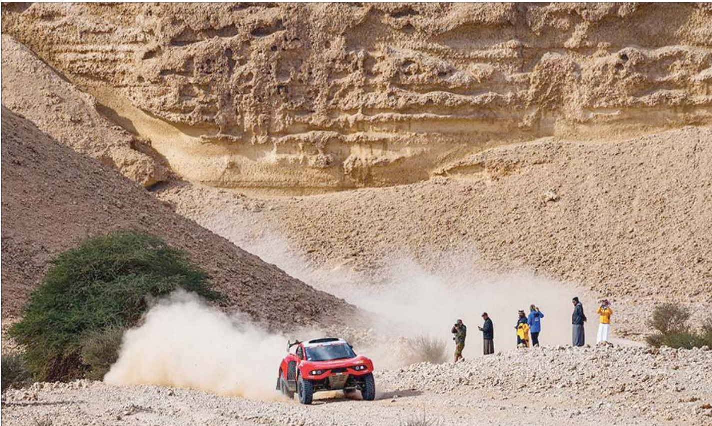
الأرجنتيني تيرانوفا طار بصدارة المرحلة السادسة (الشرق الأوسط)

وسجل ماريك 3 ساعات و 39 دقيقة و 24 ثانية حجز بها صدارة ترتيب الفئة، ومتقدماً بفارق 3 دقائق و 4 ثوان عن المسائق البرازيلي رودريغو لوبي دي أوليفيرا في المركز الثاني، فيما حل الروسي سيرجي كاريكان في المركز الثالث بفارق 3 دقائق و 6 ثوان عن