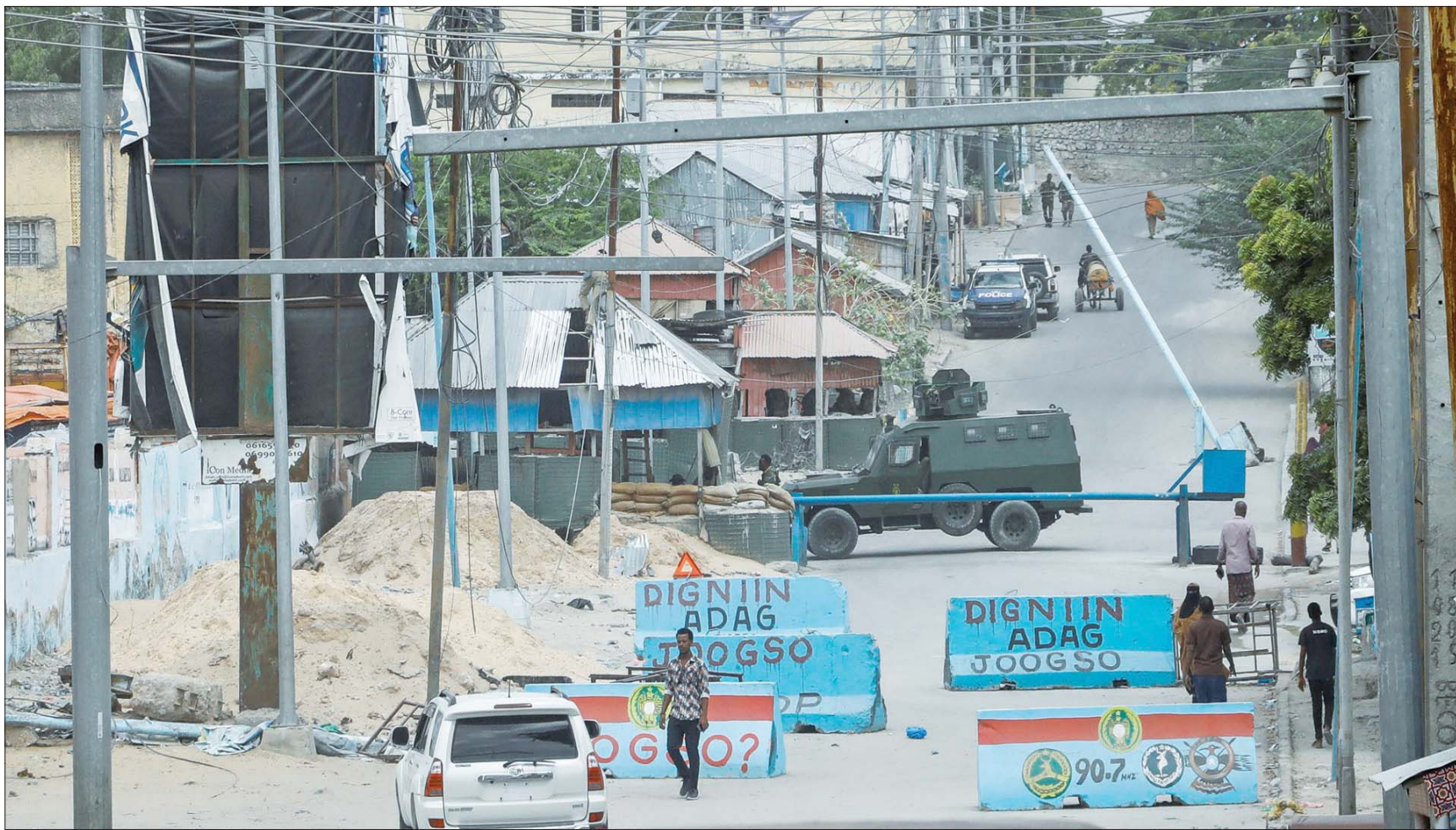
القاهرة، فتحية الداخني

عقد رئيس الوزراء الصومالي محمد حسين روبلي طوال يومي الثلاثاء والأربعاء الماضيين «المؤتمر التشاوري الوطني حول عملية الانتخابات» بمشاركة الحكومة الفيدرالية والولايات بهدف تسريع خطوات العملية الانتخابية. وهو المؤتمر الذي دعت ماري كاترين في، مساعدة وزير الخارجية الأميركية، الرئيس محمد عبد الله فرماجو إلى دعمه، مطالبة بـ«بقاء القوات المسلحة على الحياد وتحاشي التطور في الأحداث السياسية». وكانت واشنطن قد أكدت كذلك دعمها «اتخاذ إجراءات ضد من يحاولون عرقلة عملية السلام في الصومال»، بحسب تغريدة لـ«مكتب شؤون أفريقيا التابع لوزارة الخارجية الأميركية».