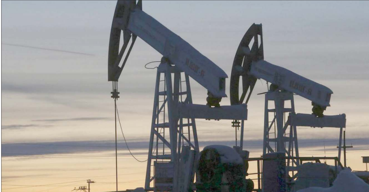
التزام «أوبك بلس» بالسياسة الإنتاجية يساهم في استقرار أسعار النفط