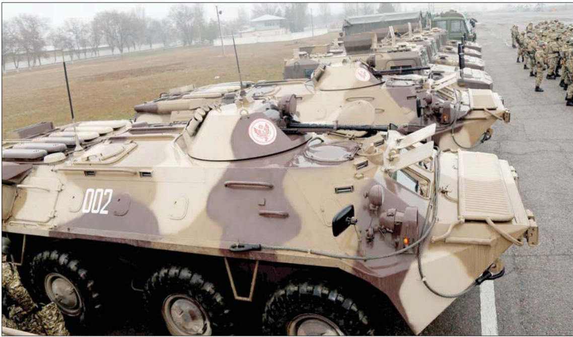
قوات تتمركز في قاعدة في قرغيزستان تستعد للمغادرة إلى كازاخستان

في الوقت ذاته، أكد توكاييف نجاح الحملة الأمنية - العسكرية في إعادة النظام الدستوري «إلى حد كبير» في غالبية مناطق البلاد. وقال إن «قوات إرساء النظام تبذل جهوداً حثيثة، والنظام الدستوري أعيد إلى حد كبير في كافة