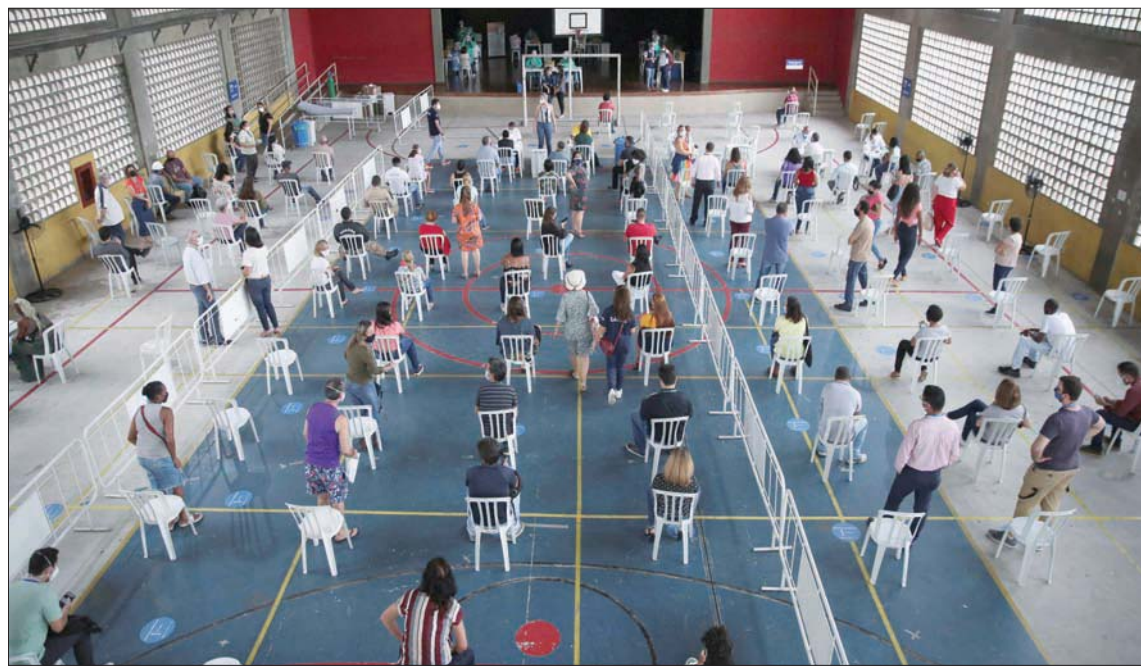
مركز فحص «كورونا» في مدينة ريو دي جانيرو أول من أمس (رويترز)

وكانت المؤشرات الأولى على هذا التصدر قد ظهرت أواخر الشهر الماضي، عندما أفادت إحصاءات المؤسسة الدولية للبيانات بأن أميركا الجنوبية تحتل المركز الأول في العالم، من حيث نسبة السكان الذين تناولوا