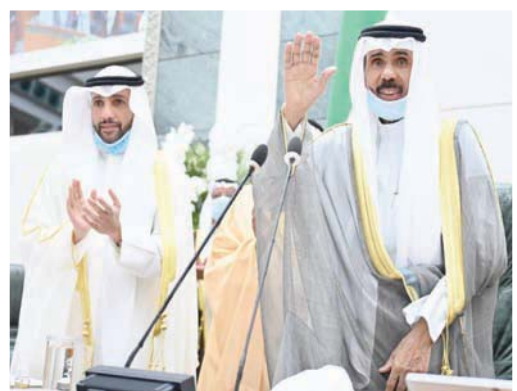
الأمير الشيخ نواف الأحمد الجابر الصباح لدى دخوله قاعة مجلس الأمة صباح

تعتمد الحكومة الجديدة على حسن النيات التي أحدثتها جهود المصالحة، بل حرصت نفسها من أي مساعٍ لطرح الثقة، عبر توزيع عدد من النواب في صفوفها، تنقي بهم -ولو مؤقتاً- العواصف السياسية.