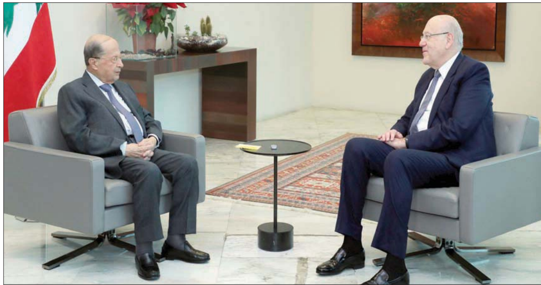
الرئيسان ميشال عون ونجيب ميقاتي خلال اجتماعهما أمس، في إطار المشاورات التي يجريها عون مع رؤساء الكتل النيابية تحضيراً لمؤتمر الحوار الوطني الذي ينوي الدعوة إليه.

بيروت، «الشرق الأوسط» رفض رئيس الحكومة السابق، رئيس «تبار» المستقبل، سعد الحريري المشاركة في الحوار الوطني الذي دعا إليه رئيس الجمهورية ميشال عون معتبراً أن هذا الأمر يجب أن يحصل بعد الانتخابات النيابية المقبلة، فيما ينتظر أن يتلقى عون جواباً مماثلاً من «القوات اللبنانية» وأعلن مكتب الحريري الإعلامي في بيان له أن الحريري «أجرى اتصالاً برئيس الجمهورية إثر تلقي بيت الوسط (مقر الحريري في بيروت) اتصالاً من دعوة الرئيس عون إلى