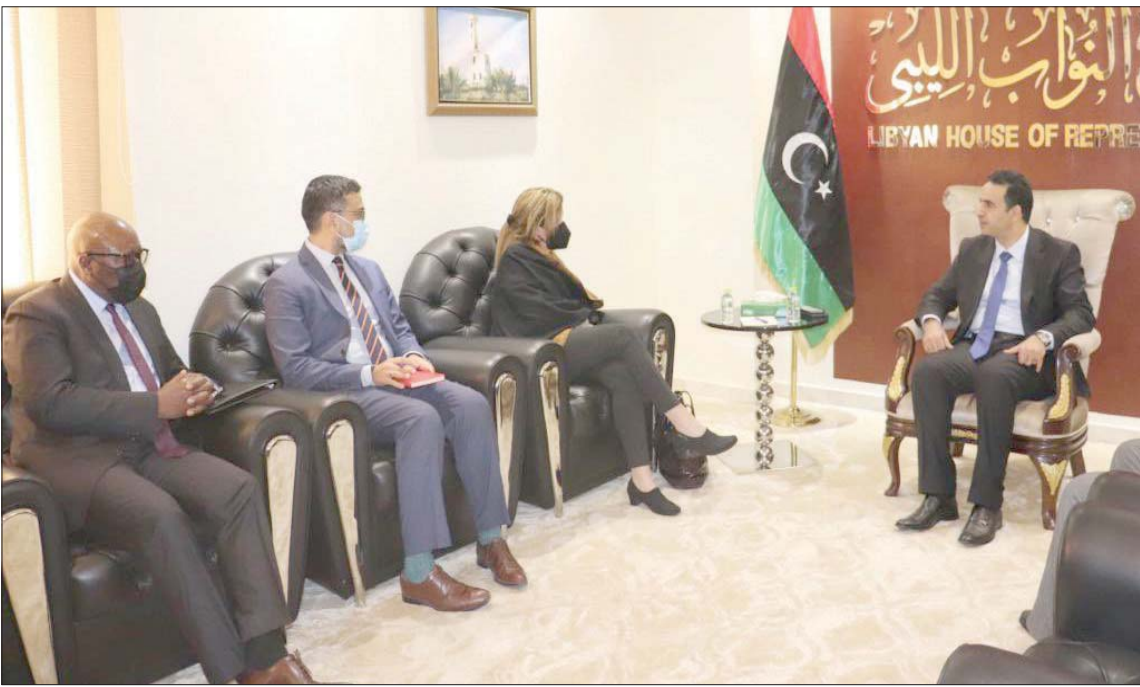
رئيس مجلس النواب فوزي الثوري يلتقي في طرابلس ستيفاني ويليامز مستشارة الأمين العام للأمم المتحدة بشأن ليبيا

وبعدما شجب الثوري، باسم مجلس النواب أي تدخل مهمما كان نوعه، دعا جميع الجهات الرسمية للتنسيق الكامل مع وزارة الخارجية في حكومة «الوحدة»، باعتبارها القناة الوحيدة للتواصل مع الأطراف الخارجية، كما دعا المنفي إلى مرارة الدول المخترقة في الشأن الليبي بأهمية التنسيق فيما يتعلق بالبيانات التي تصدرها سفارتها المعتمدة لدى ليبيا.