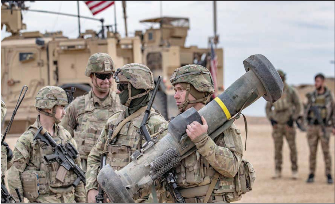
جنود أميركيون خلال تدريبات مع «قوات سوريا الديمقراطية» في دير الزور شرق سوريا في 7 الشهر الماضي

وقال المرصد السوري لحقوق الإنسان: «بأنه سجل «خروج» رتل يضم البيات محملة بالمعدات اللوجيستية والعسكرية من قاعدة