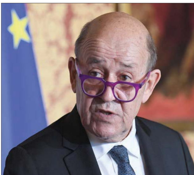
وزير الخارجية الفرنسي

«تسمع كلاماً جيداً من الأميركيين ولكن المهم رؤية أفعال عملية وجادة»، وفي تصريحات صحافية أخرى، لمح لوردريان وواشنطن عرضها إيصال الرسائل وتسهيل التفاوض الأمر الذي يذكر بما حصل في مسقط من مفاوضات سرية مباشرة بين موفدين أميركيين وإيرانيين سهلت التوصل إلى اتفاق فيينا صيف عام 2015، ولاحتمال الصورة، تتعين الإشارة إلى تواصل تصريحات المفاوض الروسي دائماََ العتقال التي بدلي بها بعد كل اجتماع في العاصمة النمساوية.