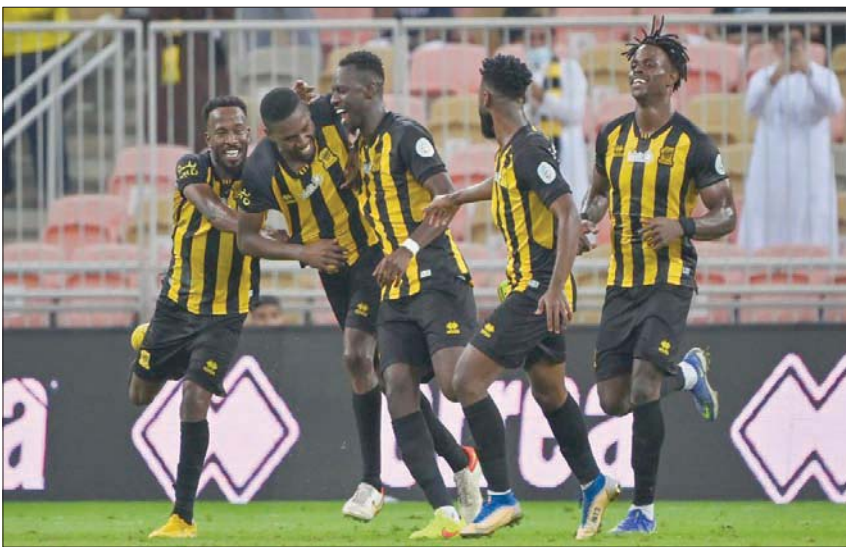
فرحة اتحادية بعد الهدف الأول أمام الفيحاء

وفي مدينة بريدة، يبحث الرائد عن استعادة انتصاراته عندما يستضيف نظيره فريق الفتح الذي يملك ذات السبب بعد تعثره أمام النصر في الجولة الماضية رغم الغيابات الكبيرة التي أحاطت بالفريق حينها بسبب فيروس «كورونا»، فيما يتطلع الرائد لاستعادة نغمة انتصاراته بعد خسارته في الجولة الماضية أمام أبها.