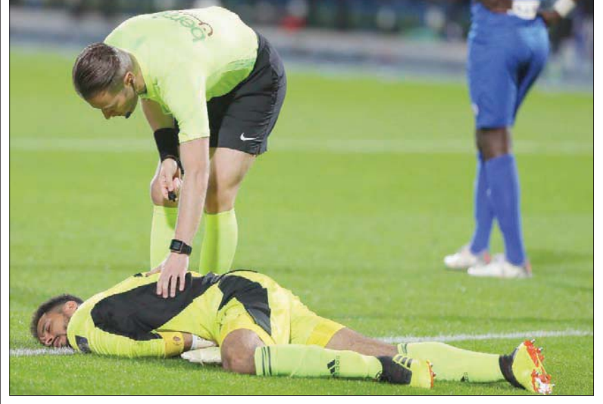
الفيصلي هاجم حكم مباراة السوبر أمام الهلال