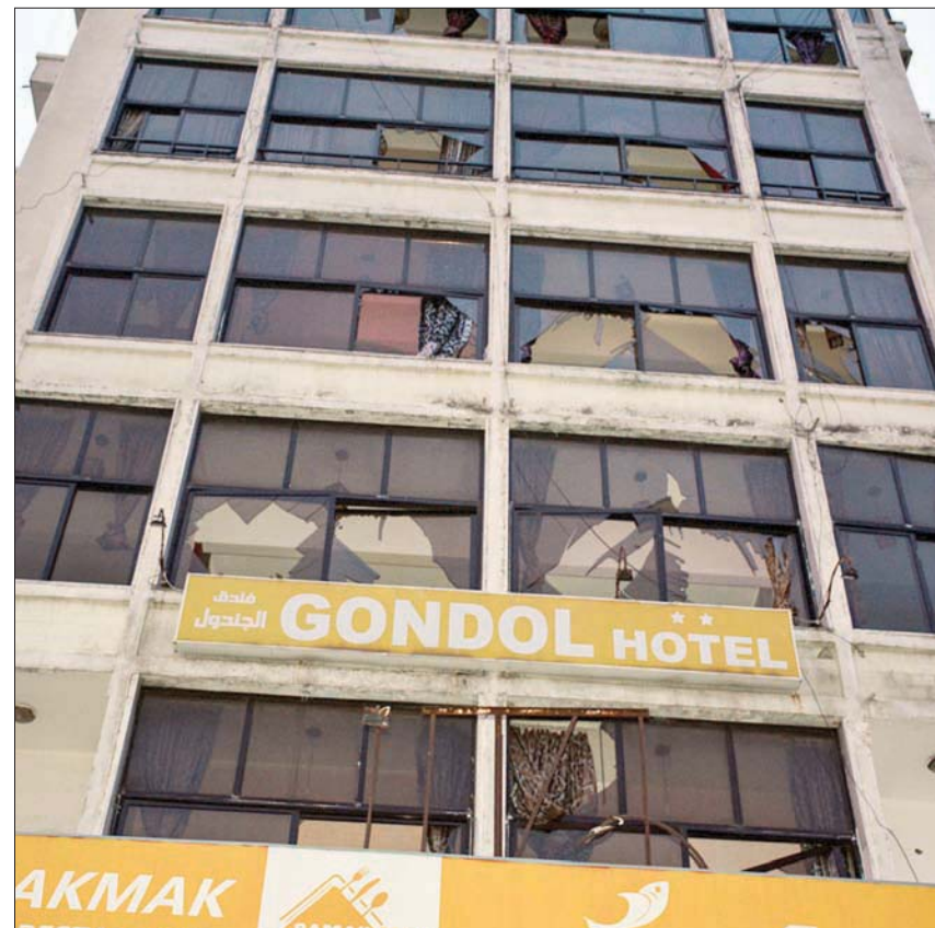
زجاج مكسور في مبنى في اللاذقية جراء قصف إسرائيل على الميناء في 28 الشهر الماضي