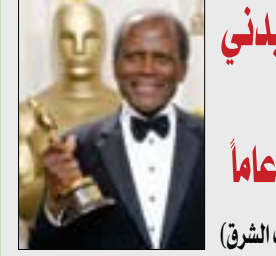
رحيل سيدني بوتاييه عن 94 عاماً (يوميات الشرق)