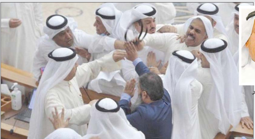
اشتباك داخل مجلس الأمة الكويتي

مشكلات الكويت السياسية والاقتصادية والاجتماعية لا تزال تتفاقم بلا مبرر، فيما تترك دول خليجية الكويت وراءها لتندب حظها! التحديات الجديدة كثيرة، وعلى رأسها حجم الفساد كماً وكيفا؛ فالكويت كالكثير من الدول عرفت الفساد عبر تاريخها... ولكنه اليوم ساد وظهر في القاع والقيمة، وبات في أمس الحاجة إلى قرارات حازمة، ومقاريض حادة، ومن المستبعد -في اعتقادي- أن تصدر، وأن تنفذ، مثل هذه القرارات... أو أن يرى أحد هذه الأدوات تعمل متجاهلة «هذا».