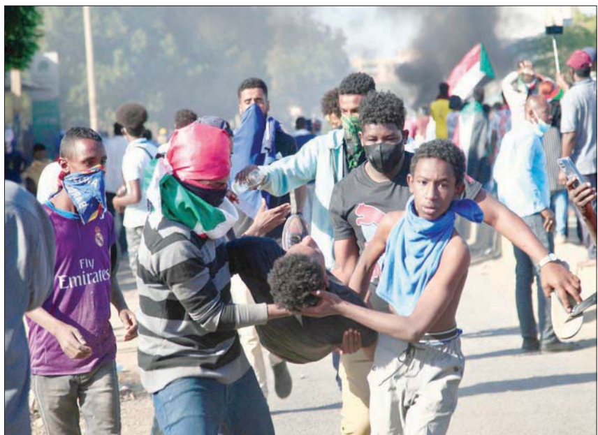
المحتجون يسعون أحد الصابيين في أم درمان الخميس الماضي

السلطة مع الجيش قبل 25 أكتوبر حين حلت القوات المسلحة الحكومة والمجلس السني القديم وأعلنت حالة الطوارئ في البلاد، مجلس الأمن التابع للأمم المتحدة بإجراء تحقيق في ما وصفه بأنه قتل عمد وهجمات على المستشفيات. يذكر أن المشاركين في الاحتجاجات الأخيرة يوم الخميس الماضي، حاولوا الوصول إلى القصر الرئاسي وسط الخرطوم، لكن قوات الأمن تقدمت نحوهم واطلقت قنابل الغاز المسيل للدموع، في حين استخدم بعض المتظاهرين الأفعنة الواقية من الغاز، ووضع كتيرون آخرون كممامات طبية على وجوههم واستخدموا أغصية أخرى للوجه، كما اعتمر البعض خوذات وقفازات لإعادة عبوات غاز من حيث أتت.