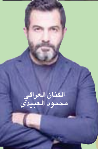
الفنان العراقي محمود العبيدي

العبيدي: «لا أستطيع تجاهل توثيق العلاقة مع وطني الذي أنتمي إليه، ولا أملك حالة من الحيادية الكريهة تجاه من يتخلون عن الوطن باسم الديمقراطية متجاهلين ما لحق به من دمار».