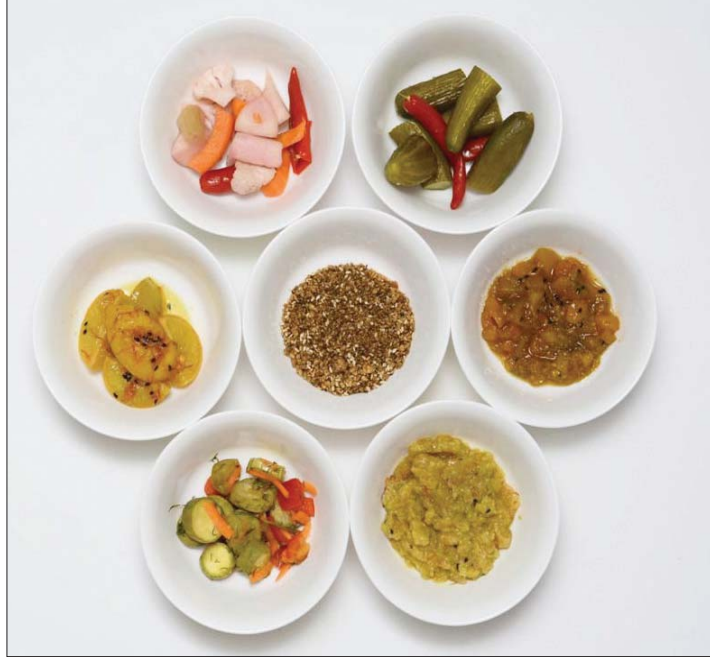
المخلل دخلت إليه الفاكهة بالإضافة إلى الخضراوات التقليدية المعروفة