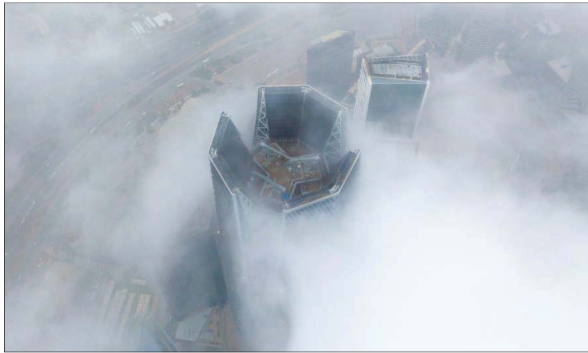
القطاع الخاص السعودي لمشاركة حكومية أوسع لتحسين بيئة الأعمال وتذليل العقبات (الشرق الأوسط)

المملكة المختلفة وإزالة العوائق والتحديات بناءً على منطقة الغرفة وصولاً إلى تحقيق رؤية المملكة، وقد حققت عدداً من