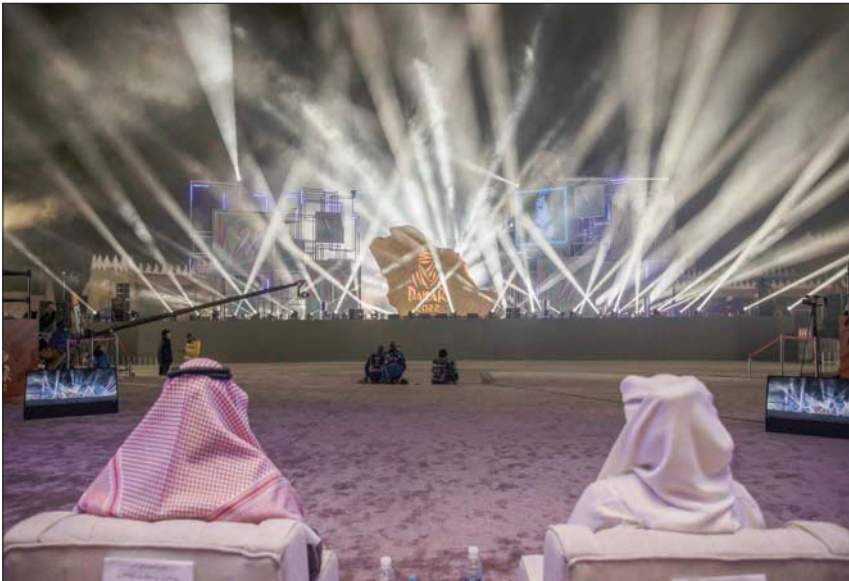
جانب من حفل افتتاح رالي داكار في المغوة أمس بحضور أمير حائل (الشرق الأوسط)