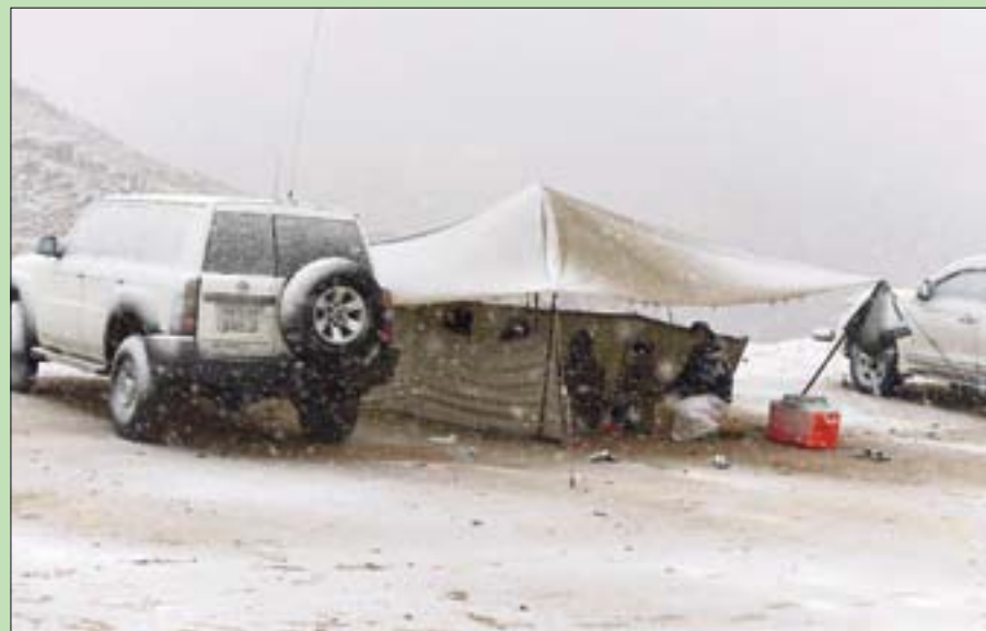
قام البعض بالتخييم فوق الجبل للاستمتاع بالأجواء

ستتسبب في انخفاض درجات الحرارة لأدنى من الصفر ومزيد من تساقط الثلوج. وبين القططاني أن شمال المملكة هو أول المناطق التي تواجه الموجات الباردة، وهي التي تسجل أدنى درجات حرارة والتي تساقط عليها الثلوج، إلا أنه في بعض الأوقات الوسطى وأجزاء من المناطق الشرقية سجلت في أعوام ماضية درجات حرارة أدنى من الشمال، كما أنه توجد حالات خاصة تحدث في بعض المناطق كسقوط الثلوج التي حدثت العام الماضي في جبال بلسم في المناطق الجنوبية في المملكة بعد أن تهيأت عدة ظروف أدت إلى حدوث هذه الحالة.