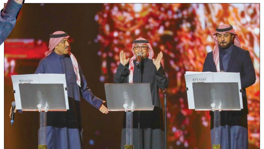
ماجد المهندس وعبد المجيد عبد الله وأصيل أبو بكر سالم

وقال الموسيقي السعودي ضياء عزوني إن التطور الذي تشهده السعودية كل عام، خاصة في