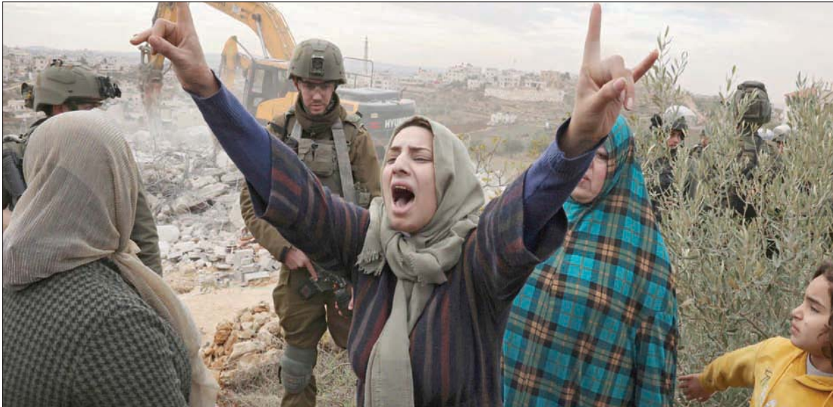
فلسطينية تستغيت بينما أليات إسرائيلية تهدم منزلها في الخليل بالضفة الغربية في 28 ديسمبر (أغسطس)

وقال دفوري: «هذه القصة تبرز أهمية الحفاظ على التنسيق الأمني مع الفلسطينيين. هذا هو الموضوع الرئيسي الذي بحثه غانتس للفلسطينيين». وقال كوخافي في مقابلة مع «الشرق الأوسط» في 28 ديسمبر (أغسطس) 2021، أن «إسرائيل حفرتها في الضفة الغربية، ومارست ضغوطاً شديدة عليها، فاسترد رجالها الذين في نهاية المطاف دخلوا إلى جنين وعملوا ضد المنظمات الإرهابية هناك، صادروا وسائل قتالية، واعتقلوا ناشطين كثيرين».