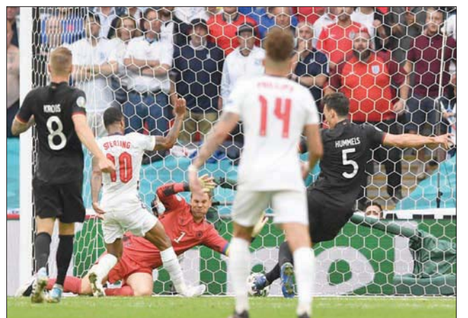
ألمانيا تودع كأس الأمم الأوروبية (يورو 2020) من دور الـ16 بالخسارة أمام إنجلترا

القادمين، وحينها فقط سيدرك فليك أين يقف فريقه بالتحديد. وقال فليك: «هذا هو المكان الذي يتعين علينا أن نتخذ فيه الخطوة التالية»، وأصفاً في الوقت ذاته القرعة بأنها «مثالية وجذابة» لأننا «يمكننا أن نقيس أنفسنا ضد المنتخبات التي نلعبها». وأضاف فليك: «من الضروري عندما يقتضي الأمر». من أجل تحقيق ذلك، يريد فليك بناء روح طيبة بين لاعبي الفريق والطاقم الفني للتحلص من العروض التي كانت دون المستوى في السنوات الماضية. أوضح فليك (56 عاماً): «بإمكانكم فقط أن تتنجحوا معاً. وهذه هي الطريقة التي سالتجها». وشدد فليك: «الفريق الأكثر استعداداً سيلعب أيضاً أفضل بطولة لكأس العالم». وأشار فليك إلى أن كل مونديال له أدوار مختلفة، موصفاً