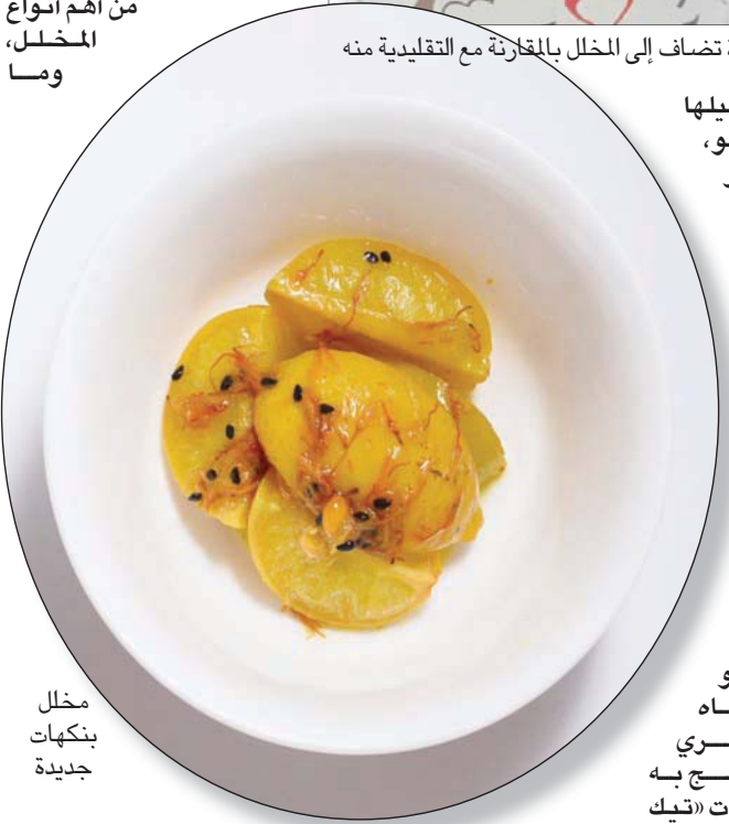
مخلل بنكهات جديدة

لكل نوع خضراوات أو فاكهة طريقة خاصة للتخليل