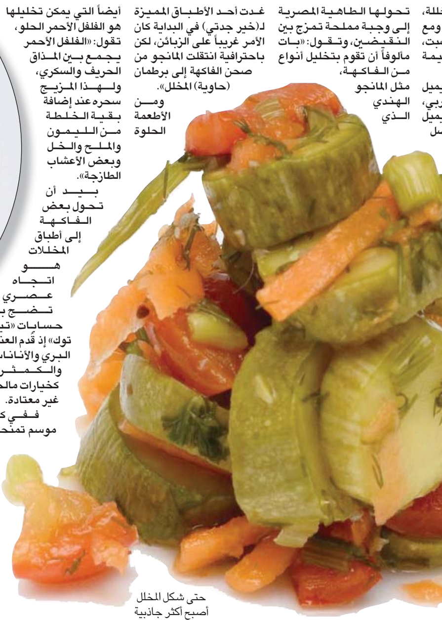
حتى شكل المخلل أصبح أكثر جاذبية

من الدول العربية تعشق الطاهية المصرية الهريسة اللببية «تميزت في تقديم هذه الهريسة المجهزة من الفلفل الأحمر والثوم، بالإضافة أخرى أعطتها مذاقاً ساحراً، وأخيراً الباذنجان الذي اعتبره (جوكر) الخضراوات، فكم من وصفات يمكن تقديم الباذنجان مع عيون الجمال على الطريقة الشامية، وصولاً إلى المسقعة المصرية التي يتناولها البعض كمقبلات».