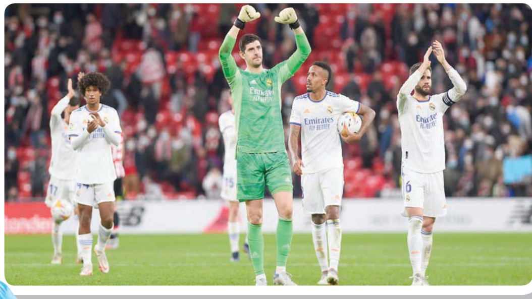
ريال مدريد يتطلع لتعزيز صدارته في الدوري الإسباني

مدريد المتصر والذي لعب مباراة أكثر، كما أنه خرج خالي الوفاض من دور المجموعات لمباراة دوري أبطال أوروبا. وكان برشلونة الذي يعاني أيضاً صعوبات مالية أسفرت عنها فشله في التجديد لنجمه الأرجنتيني ليونيل ميسي المنقل إلى باريس سان جيرمان الفرنسي في أغسطس (آب)، يسعى إلى تعزيز خط هجومه بعدما اضطر مهاجمه الأرجنتيني الآخر سيرخيو أغويرو، المنقل إلى صفوفه هذا الصيف في صفقة مجانية من مانشستر سيتي بالذات، إلى الإعلان عن اعتزاله اللعب نهائياً في منتصف الشهر الماضي، بسبب مشاكل في القلب.