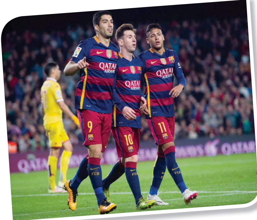
نيمار قضى أجمل فترة في مسيرته في برشلونة مع ميسي وسواريز

التي تتناسب مع قدراته وإمكاناته الحقيقية، وغيرها من الانتقادات الأخرى. لكن بالنسبة لأي شخص يحب مشاهدة نيمار وهو يلعب، فإن فكرة تراجع مستوى اللاعب البرازيلي بهذا الشكل هي حقيقة مثيرة للحنن في حقيقة الأمر. ويجب أن نشير إلى حقيقة ثابتة وواضحة وهي أن نيمار قدم مستويات رائعة في كثير من الأحيان مع باريس سان جيرمان ومنتخب البرازيل في المباريات الكبيرة، وجاءت أفضل فرصة له للفوز بدوري أبطال أوروبا كنجمة مدع رئيسي قبل عامين تحت قيادة المدير الفني الألماني توماس توخيل، ولعب دوراً حاسماً في وصول باريس سان جيرمان للمباراة النهائية، وكان من الممكن أن تتغير الأمور تماماً لو سجل كيليان مبابي الفرصة السهلة التي أتاحت له أمام بايرن ميونخ. لقد أحرز نيمار ما يقرب من 200 هدف في كرة القدم الأوروبية، لكنه لم يسجل أي هدف في دوري أبطال أوروبا منذ عام، ولا يساعده في ذلك أنه يلعب في فريق مكون من كتيبة من النجوم والأسماء الأعلامية، بقيادة النجم الأرجنتيني ليونيل ميسي. صحيح أن المدير الفني لباريس سان جيرمان يحدد الأدوار والمهام للاعبين قبل المباريات، لكن في بعض الأحيان يمكنك أن تشاهد هذا الثلاثي الهجومي - نيمار وميسي ومبابي - وهم يتجولون في أجزاء مختلفة من الملعب، ومن السهل أن تشعر بالقلق على نيمار وسط كل هذا.