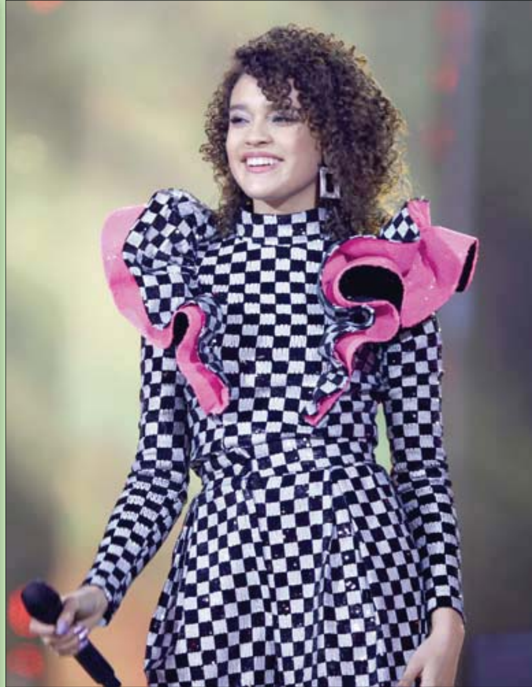
المغنية البولندية سارة جيمس لدى مشاركتها في حفل رأس السنة للتلفزيون البولندي

لقد أطلق الرئيس السوري ما يسمى: (سوريا المغفدة) وما هي المغفدة تلك... هل هي من خلال التهجير القسري واستراتيجية الحصار والتجويع، والتخدير (الديموغرافي)، ونتج عن تلك (الفائدة): أنه في عام 2011 كان الإسماعيليون يشكلون (2) في المائة) والدروز (1) في المائة) والشيعية (1) في المائة) والمعلويون (21) في المائة) والسنّة (69) في المائة). تم تغير الحال وانقلبت الموازين عام 2016، فالإسماعيليون أصبحوا (3) في المائة) والدروز (1) في المائة) والشيعية (13) في المائة) والمعلويون (24) في المائة) والسنّة (52) في المائة) - هذا غير (المالين) المهجرين. ليس لدي أي اعتراض أو حساسية من أشقائنا العرب السوريين بمختلف طوائفهم، سواء زادوا أم نقصوا، ولكنني ضد هذا (التغول) الإيراني الفارسي الذي منح امتيازات كبيرة في المناطق والأحياء في العاصمة، مع تدفق الاستثمارات الإيرانية، ولا ننسى كذلك الاستثمارات العقارية (الحزب الله)، والكل يعلم عن علاقته الوجودية مع ولاية الفقيه الإيرانية. وهكذا أصبح حال سوريا البلد العربي المؤسس مع إخوانه (جامعة الدول العربية)، الذي كان يطلق قديماً على سوريا مع العراق ومع لبنان اسم (الهلال الخصيب)، ولا أدري هل يحق لنا الآن أن نطلق عليه اسم: (الهلال المدرم) - مع سبق الإصرار والترصد.