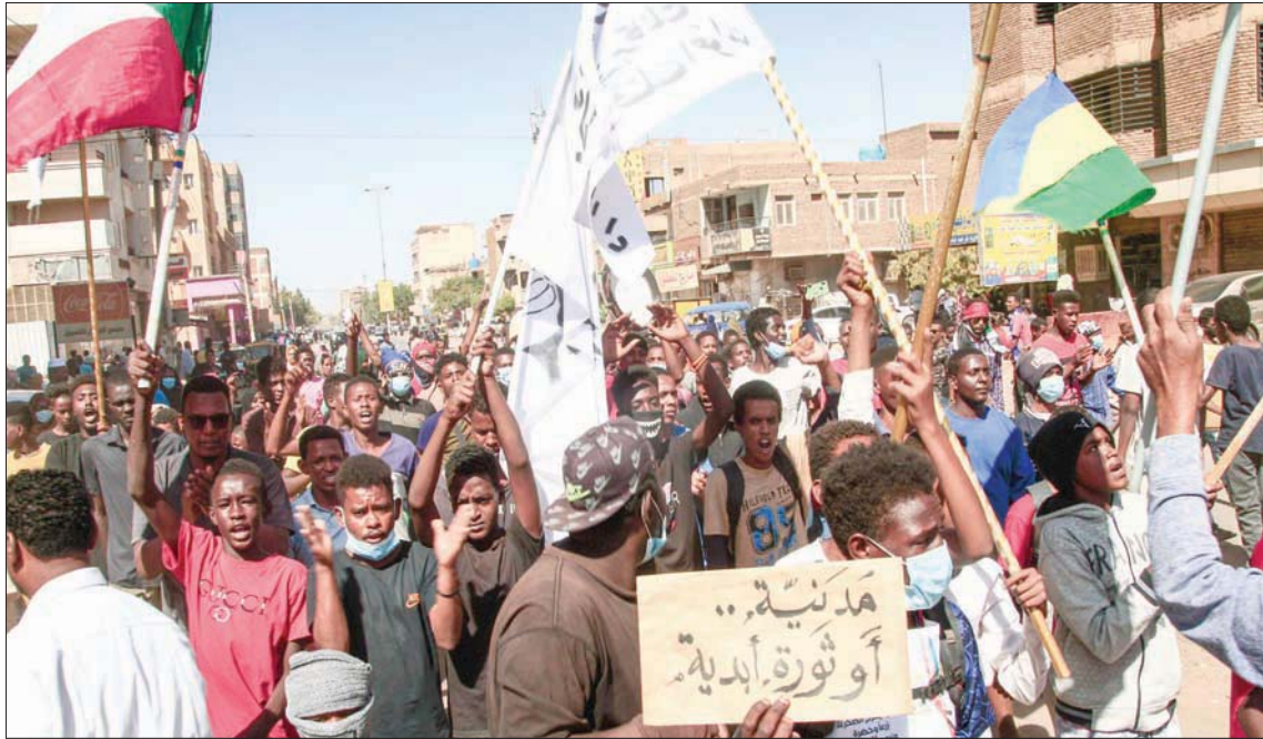
مسيرات في شوارع الخرطوم يوم 30 ديسمبر (أ.ب)

لانتهاكات الأخرى للحقوق الأساسية للإنسان لا تسهم في خلق بيئة مواتية لاستعادة المسار الديمقراطي السلمي في السودان. واحترام الحق في التجمع السلمي والسماح للمتظاهرين المنتظمين بالتظاهر، وعدم استخدام العنف ضدهم، والسماح لهم بالتعبير عن أنفسهم بحرية حيث شكلت السلمية أحد المبادئ الرئيسية وراء انتصار الثورة السودانية ولا تزال مبدأ يلتزم به معظم الذين يخرجون للشوارع للتعبير عن مطالبهم بكل شجاعة. وأكد أن الأمم المتحدة ملتزمة بدعم شعب السودان لتحقيق تطلعاته نحو سودان ديمقراطي، أجل التعاون على إرساء مجتمع عادل وسلمي يستحقه الشعب السوداني. وارتفع عدد القتلى في الاحتجاجات التي شهدتها مدن السودان إلى 54 ومئات الجرحى منذ استيلاء الجيش على السلطة في 25 من أكتوبر (تشرين الأول) الماضي. وتواجه السلطات العسكرية انتقادات حادة من الداخل والخارج بسبب العنف المفرط واستخدام الأجهزة الأمنية الذخيرة الحية