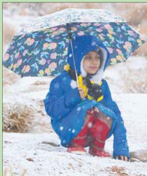
فتاة تحتمي بمظلتها من تساقط الثلوج في جبل اللوز