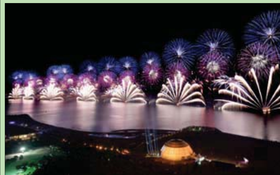
رأس الخيمة، «الشرق الأوسط»

نجحت إمارة رأس الخيمة بالإمارات في إبهار مئات الآلاف من الزوار من شتى أرجاء العالم، ومنحتهم تجربة استثنائية بكل المقاييس للاحتفال برأس السنة الجديدة، مع مشاهدة عروض غير مسبوقه للألعاب النارية التي حققت لقبين من موسوعة «غينيس» للأرقام القياسية.