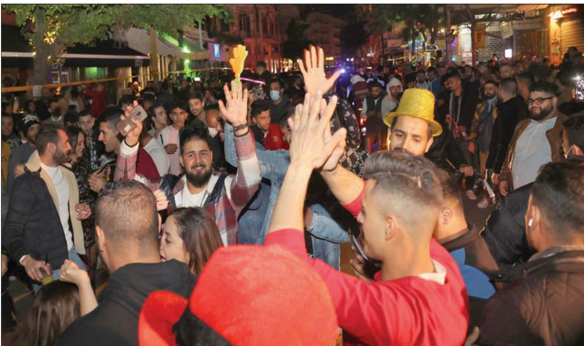
لبنانيون يحتفلون برأس السنة الميلادية الجديدة 2022

واضن كتب ميقاتي في تغريدته له على «تويتر»: «أحيي الجيش والقوى الأمنية، قيادة وضباطاً وأفراداً على عملهم لحفظ الأمن رغم الظروف القاسية التي يعيشونها، وأقدر الجهد الاستثنائي الذي بذلوه ليلة رأس السنة ومخاطرهم على تطبيق القرارات المتخذة للحد من انتشار كورونا»، مضيفاً: «بإذن الله ستكون السنة الجديدة للعمل على وضع الوطن على سكة التعافي». وصباح أمس بعد انتهاء