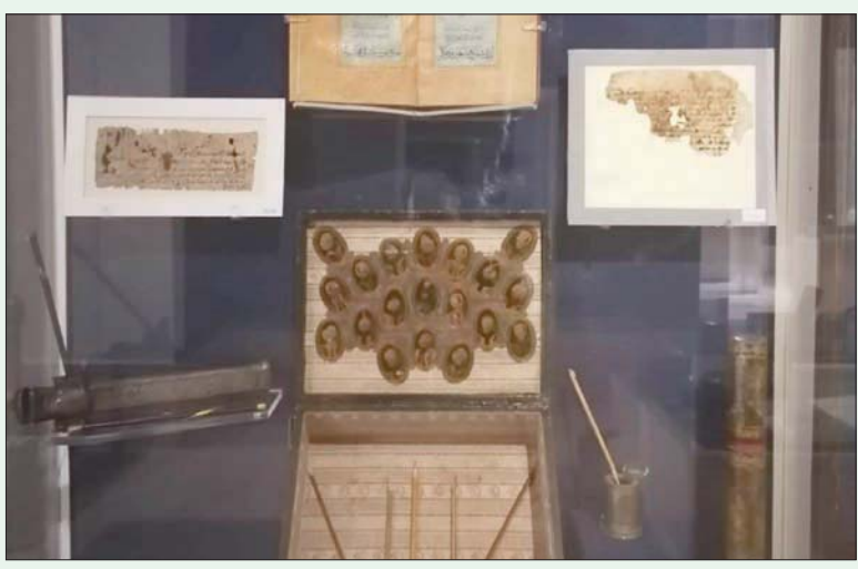
مخطوطات نادرة تبرز بدايات تطور الخط العربي