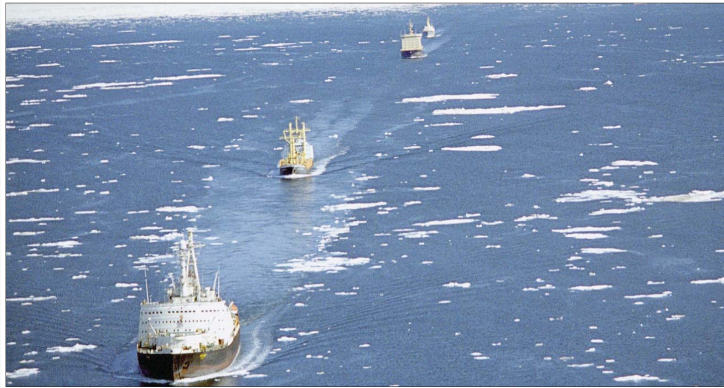
سفن في الممر البحري الشمالي

خلال عام 2021، مقارنة بمدى 24 ساعة بما فيها العطلات والإجازات الرسمية خلال عام 2022، تشجيعاً لجذب عملاء جدد لاستخدام الميناء الغربي السويس، في إطار التحديات البحرية التي تظهر يوماً بعد يوم، خاصة مع ترسيخ دور الممر الملاحى الشمالي الذي يقصر الرحلة بين آسيا وأوروبا بنحو نصف الوقت الذي تفره قناة السويس. تعتبر القناة أسرع ممر بحري بين القارتين، وتوفر نحو 15 يوماً في المتوسط من وقت الرحلة عبر طريق رأس الرجاء الصالح، ويعبر من خلالها نحو 10 في المائة من إجمالي حركة التجارة العالمية، وما يقرب من 25 في المائة من إجمالي حركة البضائع عالمياً، و100 في المائة من إجمالي تجارة الحاويات المقولة بحراً بين آسيا وأوروبا.