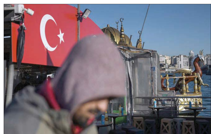
أعلنت هيئة تنظيم سوق الطاقة التركية ارتفاع أسعار الكهرباء 52% للاستخدام المنزلي و130% للاستخدام الصناعي (أ.غ.ب)

الجمهري»، كمال كليتشدار أوغلو، الزيادات الجديدة في أسعار الكهرباء والغاز الطبيعي التي طبقت بدءاً من اليوم الأول من العام الجديد، قائلًا في رسالة لإردوغان عبر «تويتر»: «لقد ضغطت على أعناق الشعب مع بداية العام. لقد زدت عليهم أسعار الكهرباء والغاز الطبيعي، بشكل كبير، وبينما ينهي الناس عامهم ويستقبلون عاماً جديداً، وضعت أنت على أعناقهم في السلام والراحة، فلن يكون هناك سلام في قصرك، ولا في المؤسسات التي أفسدتها، ولكن هذه كلمتي لك في عام 2022».