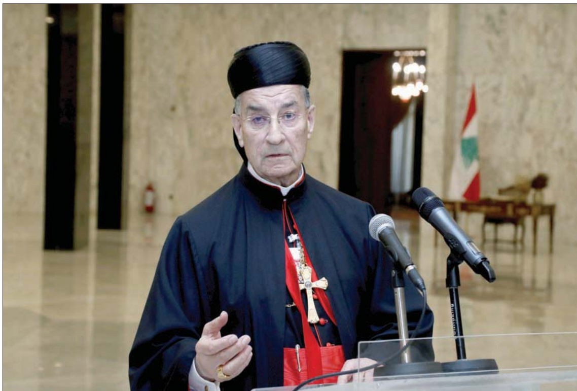
البيروت، الشرق الأوسط، اعتبر البطريرك الماروني بشارة الراعي أن لبنان «مريض بفقدان هويته التي من الواجب إعادتها»، إليه منتقداً «حزب الله» من دون أن يسميه بإسمه، و«حزب السياسيين والحزبيين الذين أتوا بحروب الآخرين إلى أرضه وذهبوا إلى حروب الآخرين في أراضيهم وهو ما أدى إلى انهياره وانعزاله عن الدول العربية والمجتمع الدولي».

المقبلة على التحضير الجدي لها وخلق الأجواء السياسية والأمنية لحصولها مع الانتخابات الرئاسية في أكتوبر المقبل، مشدداً «على ضرورة حصول هذه الانتخابات بإشراف مراقبين دوليين، وخصوصاً أنه توجد رغبة بذلك لدى الرأي العام اللبناني ولدى الأمم المتحدة». من هنا رأى أنه «إذا سلمت برعاية الإخلاص للبنان وشعبه، تكون الفترة الباقية كافية لإحياء العمل الحكومي، وإنهاء المفاوضات مع المؤسسات المالية الدولية، ولضبط الحدود ولترميم العلاقات مع دول الخليج وفي ظلها المملكة العربية السعودية، ولتصويب موقع لبنان، فينتقل من الانحياز إلى الحياد، ومن سياسة المحاور إلى سياسة التوازن». وهكذا يوفر لبنان المناخ الملائم مستقبلاً لإطلاق حوار وطني برعاية الأمم المتحدة في إطار مؤتمر دولي يعطي للحوارات ضمانات أمنية وآلية تنفيذية، فضامته الداخلية، التي لطالما رحبنا بها وأبدنا توصياتها وقراراتها، ظلت من دون تنفيذ، بل تنصل منها بعض الأطراف