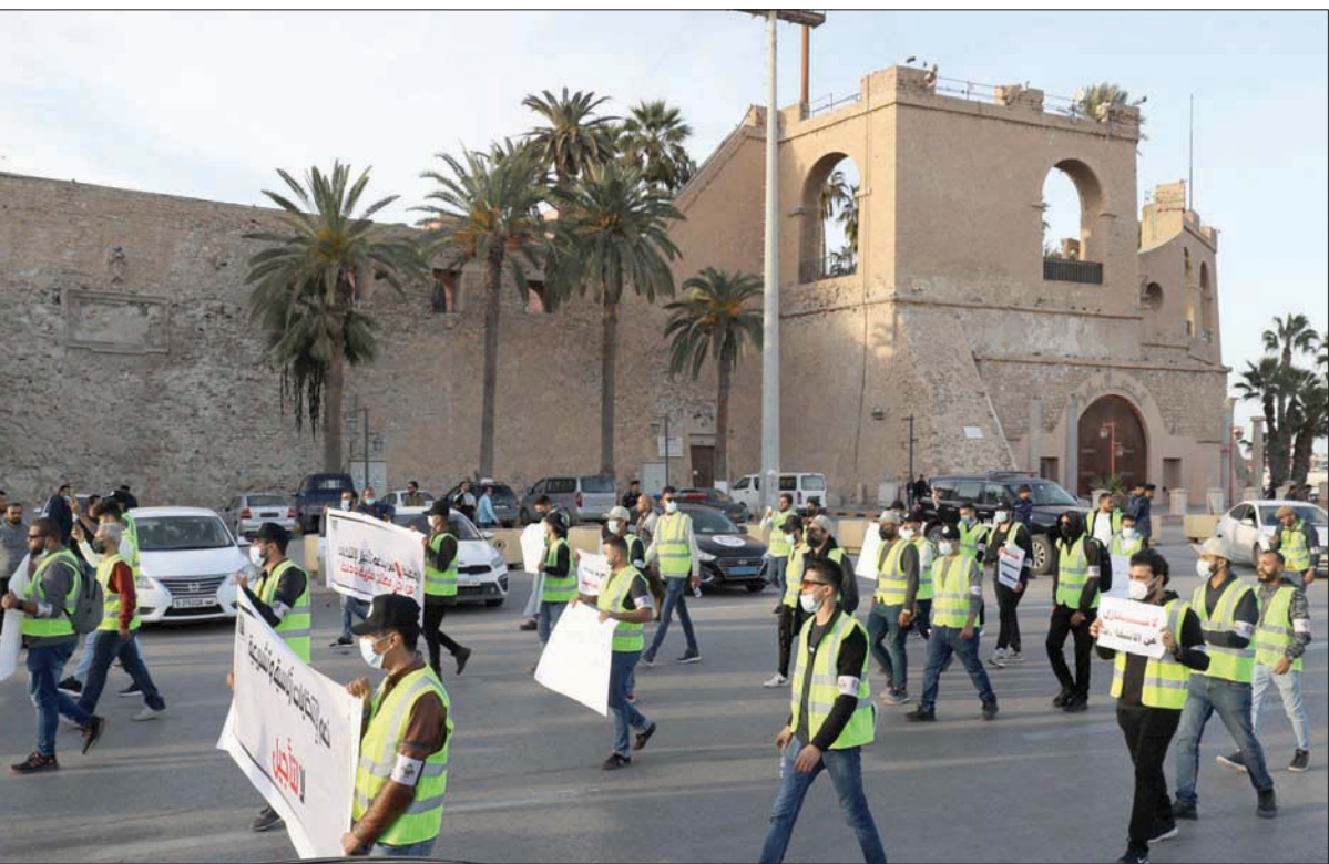
جانب من مظاهرة نظمها رافضون لتأجيل الانتخابات في طرابلس الأسبوع الماضي