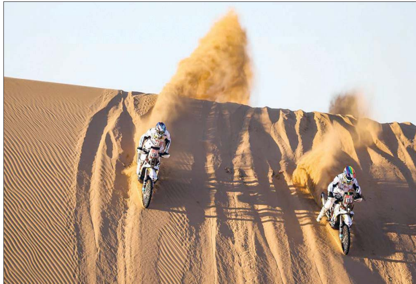
الرمال الذهبية تزين رالي داكار السعودية وسط منافسة المتسابقين (الشرق الأوسط)

التحديات التي حضرت في النسخة الحالية من الرالي هي إضافة مسافات أطول في منطقة الربع الخالي «منطقة أكثر وعورة» ومنطقة أصعب للدراجين وللسيارات، مضيافاً: «نعرف أن الربع الخالي مسافته كبيرة وشاسعة».