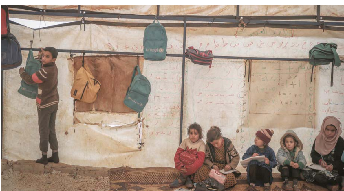
أطفال في خيمة تحولت إلى صف دراسي في مخيم للنازحين بقرية كلبي بمحافظة إدلب شمال غرب سوريا الثلاثاء الماضي

وأشار التقرير إلى أن «فرق الدفاع المدني السوري استجابت لهجوم استهدفت 169 مدينة وبلدة مختلفة في مناطق (إدلب) شمال غرب سوريا، من قبل قوات النظام السوري وروسيا، وتم فيها استخدام أكثر من 7 آلاف ذخيرة متنوعة، منها أكثر من 145 طلعة جوية (جميعها روسية) تم فيها شن أكثر من 400 غارة جوية،