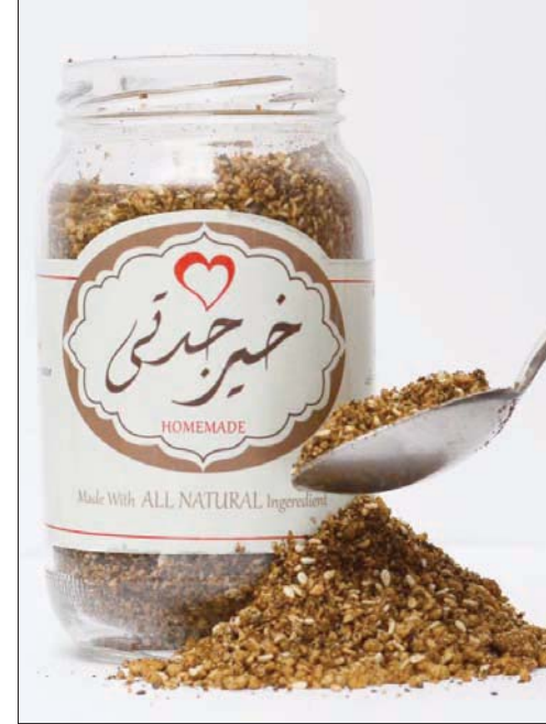
التركيز على النوعية والنكهات وطريقة التقديم