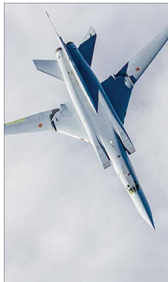
صورة من وزارة الدفاع الروسية لطائرة «تي يو 22» شاركت في مهمة سابقة لقصف مواقع «داعش» في سوريا (وزارة الدفاع الروسية)

وكان «المرصد» قد أفاد، أول من أمس، بـ«وصول 8 مروحيات روسية إلى مطار تدمر العسكري، قادمة من قاعدة حميميم الروسية في محافظة اللاذقية، في حين خرجت صباح الجمعة تعزيرات عسكرية مشتركة لـ«الفيلق الخامس» و«لواء القدس» من دير الزور، بأوامر روسية، اتجهت إلى منطقة تدمر بريف حمص الشرقي، حيث ضمت مئات الجنود وعربات مدرعة ودبابات، يرافقها طيران مروحي روسي». وتابع «المرصد» أن «القوات الروسية تنوي نشر نقاط عسكرية جديدة لتشكيلات العسكرية الموالية لها من «الفيلق الخامس» و«لواء القدس» في مدينة تدمر وباديتها، على حساب الميليشيات الموالية لإيران والمتواجدة بأعداد كبيرة في المنطقة. كما تنوي القوات الروسية البدء بحملة عسكرية واسعة بإشراف مباشر من ضباط روس فقط للبحث عن عناصر تنظيم (داعش) المتوارين في بداية تدمر والذين تصاعد نشاطهم في عموم البداية