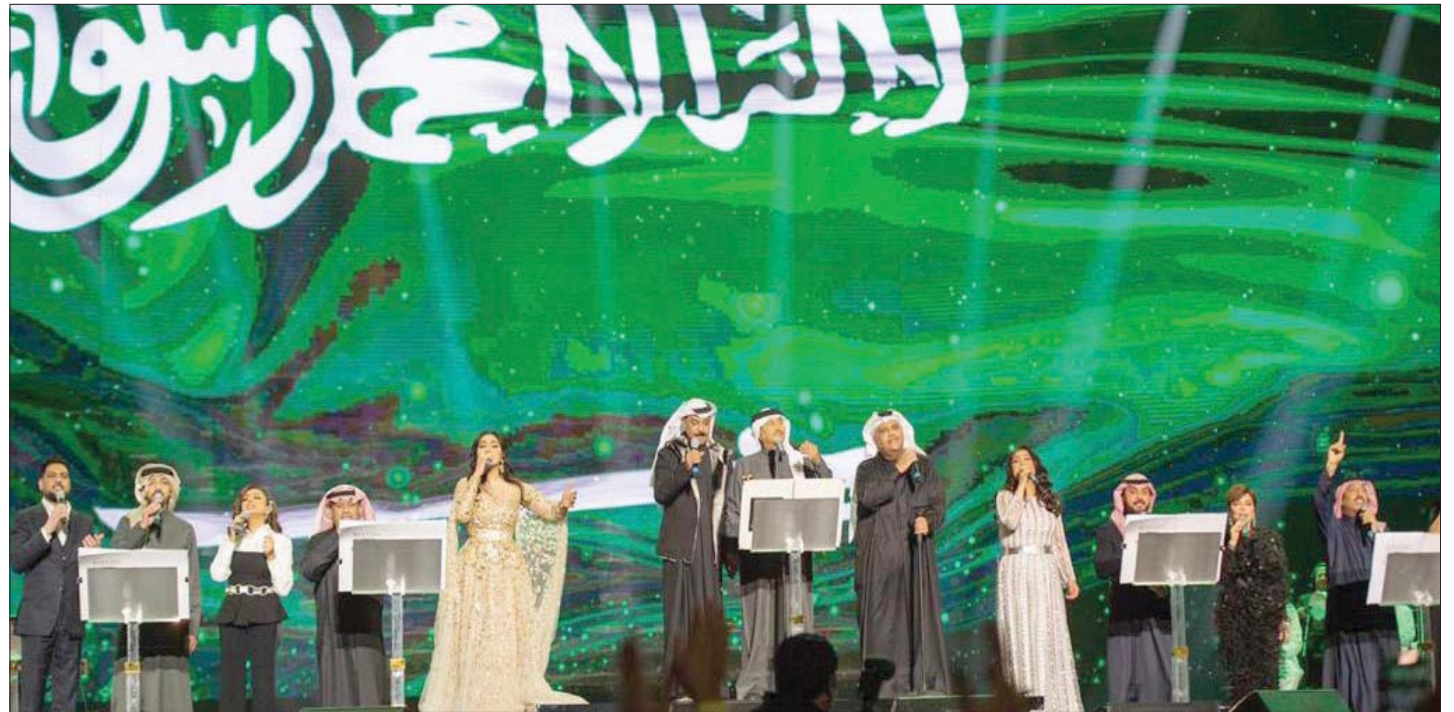
«تريو الرياض» جمع الفنانين في ليلة مميزة (موسم الرياض)

الفني، وتحديدًا الموسيقي، وذلك عبر معاهد التدريب المهنية والفنية والتعليم المحترف المفيد، وتثبيت القواعد الضرورية لإنماء هذه المواهب وإثراء الحالة الفنية في السعودية، مثل أخلاقيات الفن والحقوق والتعامل مع الجمهور والمسرح.