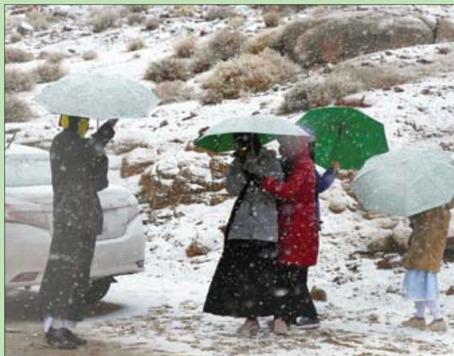
توافد المواطنون على منطقة جبل اللوز للاستمتاع بالثلوج