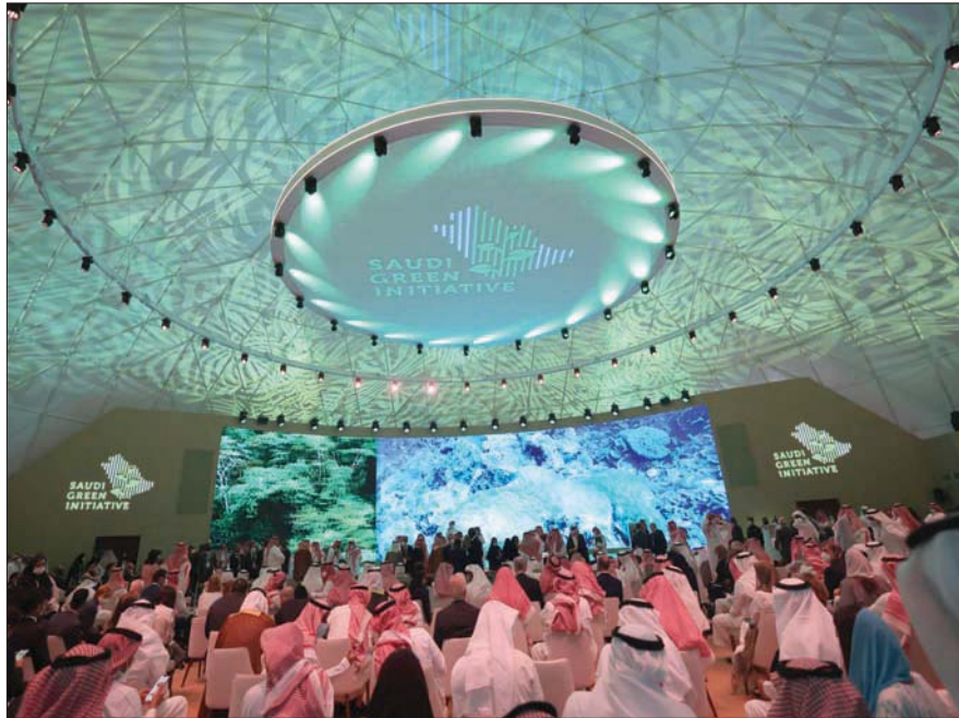
مشهد من افتتاح معرض «المبادرة الخضراء» بمدينة الرياض في 23 أكتوبر الماضي (أ.ف.ب)

شهدت سنة 2021 الكثير من الكوارث والخيبات، لكنها كانت أيضاً سنة «الأمل» البيئي. فعلى الصعيد السياسي حصلت تحولات هامة بوصول إدارة داعمة لتقضايا البيئة إلى سدة الرئاسة في الولايات المتحدة، كما شهدت السنة العديد من الابتكارات الخضراء والمشاريع البيئية الواعدة. قد يكون أبرزها مبادرة «الشرق الأوسط الأخضر» التي أطلقتها السعودية. وفي مجال الصحة العامة، حقق العلماء اختراقاً كبيراً في مواجهة فيروس كورونا المستجد عبر تطوير اللقاحات وبرامج التطعيم الواسعة، رغم عودة الفيروس ومتحوراته. وفي مواجهة الاحتباس الحراري، نجح المجتمعون في قمة غلاسكو في التوافق على تسريع العمل المناخي. وأقرت دول عدة تشريعات لخفض الانبعاثات البلاستيكية، بالتزامن مع تدابير