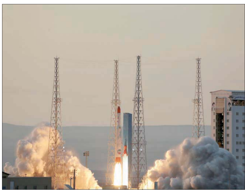
إطلاق الصاروخ الذي حمل القمر الصناعي الإيراني الخميس الماضي

من جانبها، قالت فرنسا يوم الجمعة إن إطلاق الصاروخ الذي كان يستهدف إرسال ثلاثة أجهزة للأبحاث للفضاء خرق لأحكام الأمم المتحدة، واصفة ذلك بأنه شيء «مؤسف للغاية» لأنه يأتي في وقت يجري فيه إحراز تقدم في المحادثات النووية مع القوى العالمية. ورفضت وزارة الخارجية الإيرانية انتقادات الولايات المتحدة وفرنسا وألمانيا لقيام طهران بإطلاق صاروخ قادر على حمل أقمار صناعية إلى الفضاء. وقالت الوزارة في بيان نشرته وكالة الأنباء الإيرانية «تحقيق التقدم العلمي والبحث ومنه في قطاع الفضاء حق مؤكد للشعب الإيراني وإن مثل هذه التصريحات التخيلية لن تترك أي تأثير على عزم الشعب الإيراني على تحقيق بهذا القطاع». ونفي طهران أن تكون عمليات الإطلاق الفضائي غطاء لتطوير صواريخ باليستية، أو أنها تنتهك قراراً للأمم المتحدة. وأطلقت إيران أول أقمارها الصناعية أوميد (الأم) في 2009 كما أطلقت القمر (رصد) إلى مدار حول الأرض في يونيو (حزيران) 2011. وقالت طهران في 2012 إنها وضعت قمرًا ثالثاً في مدار. وفي أبريل (نيسان) 2020 قالت إيران إنها أطلقت بنجاح أول قمر صناعي عسكري إلى مدار في أعقاب محاولات فاشلة متكررة في الشهور السابقة. ورفضت الولايات المتحدة عقوبات على وكالة الفضاء الإيرانية ومؤسساتها وعضواتها في العراق، ووافقت طهران على إطلاق صاروخ الأقمار الصناعية إلى الفضاء، مضيفاً أن هذه الصواريخ تمثل انتهاكاً لقرار صادر عن مجلس الأمن الدولي.