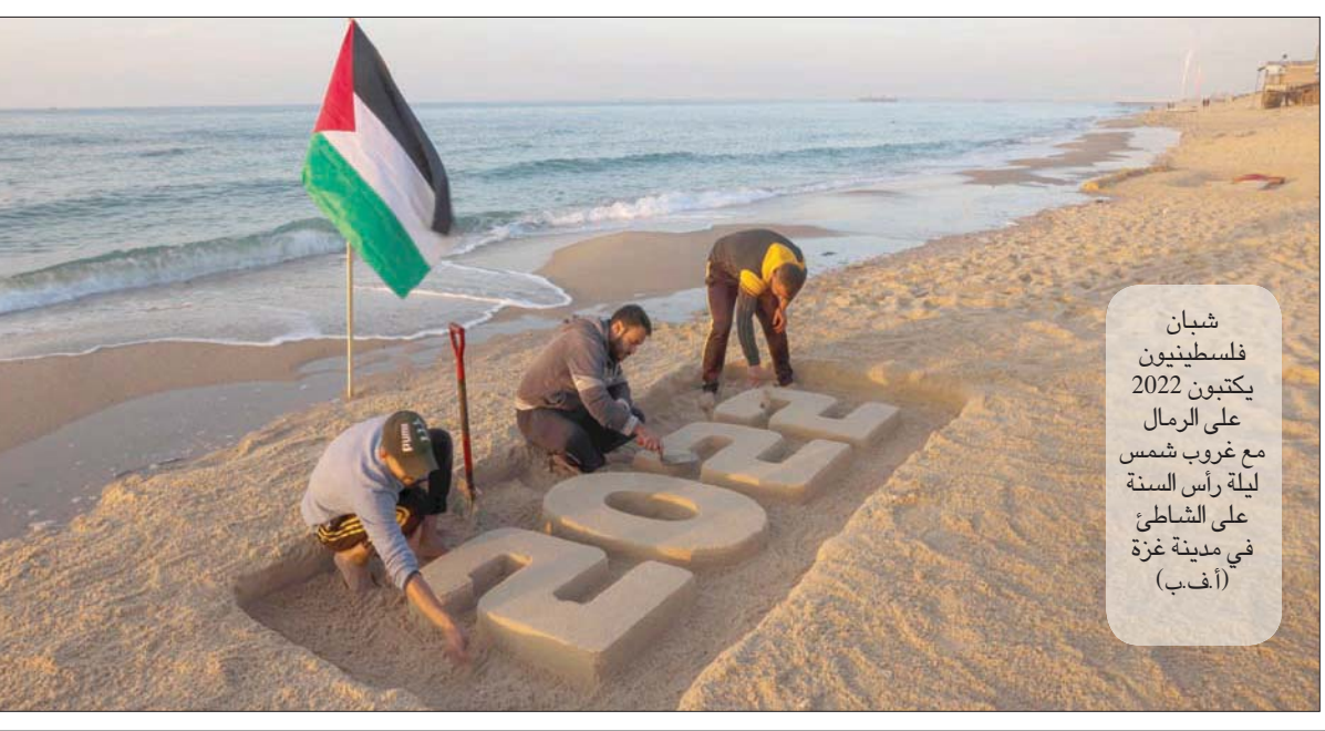
شبان فلسطينيون يكتوبون 2022 على الرمال مع غروب شمس ليلة رأس السنة على الشاطئ في مدينة غزة (أغسطس)

تلقأبيب، الشرق الأوسط، قرر الجيش الإسرائيلي حل وحدة الاستخبارات العسكرية «حتساف»، التي تخصصت في مراقبة وسائل الإعلام الناطقة باللغة العربية في العالم. وقد أكد ناطق عسكري أن القرار لا يعني التخلي عن مراقبة الإعلام العربي، بل توزيع مهام هذه الوحدة على وحدات أخرى تعمل تحت سقف «الوحدة 8200» في شعبة الاستخبارات العسكرية في الجيش الإسرائيلي. وحسب التوزيع الجديد، تقوم وحدة مراقبة السائبر بمراقبة الحسابات العربية في الشبكات الاجتماعية (تويتر وفيسبوك وإنستغرام وتك توك وغيرها)، وتقوم وحدة الناطق