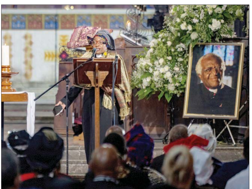
ابنة ديسموند توتو تلقي كلمة خلال جنازة والدها في كيب تاون أمس

السلطة الاستبدادية في بريتوريا. وفي سويتو خصوصاً، حيث خدم لفترة طويلة، ندد بأعمال العنف التي طاولت الطلاب خلال احتجاجات يونيو (حزيران) 1976 التي وجهت بقمع دام. ويعيد تلك الحادثة، بات صوت نيلسون مانديلا المسجون في جزيرة روبن آيلند، وتلقى تهديدات من الشرطة والجيش، ولم يفلت من السجن سوى بفضل صفته الكهنوتية. كان يقف «دعاً لنا» خلال التظاهرات السلمية التي نظمها ضد الحكم، على ما قال بانينا زلسوبو المسؤول في حزب المؤتمر الوطني الأفريقي (إيه. إن. سي) الحاكم، الذي شارك في الضال التاريخي في البلد. وذكرت غراسا مشيل أرملة مانديلا بـ«الجرأة التي لا توصف التي كان ينبغي التحلي بها وقتذاك لمواجهة نظام الفصل العنصري».