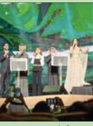
نجوم الطرب العربي في سهرة مميزة بالرياض الليلة قبل الماضية بمناسبة العام الجديد (موسم الرياض)

سيول، «الشرق الأوسط» وقال كيم في الخطاب الذي ألقاه أول من أمس في نهاية الاجتماع العام الرابع للجنة المركزية الخامسة لحزب العمال الكوري الذي بدأ الإثنين الماضي، إن الأهداف الرئيسية لكوريا الشمالية في عام 2022 تتمثل في إطلاق التنمية الاقتصادية وتحسين حياة الناس في الوقت الذي تواجه فيه البلاد «ضراعاً كبيراً بين الحياة والموت»، بحسب وكالة «رويترز». وكان كيم قد استخدم خطابه السابقة بحلول العام الجديد لإصدار إعلانات سياسية