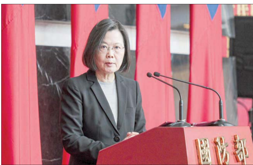
رئيسة تايوان تلقي كلمة في وزارة الدفاع بتايبيه يوم 28 ديسمبر

وشارك في حفل الافتتاح السفارة السفير الصيني بو، ومسؤولون نيكاراغويون من بينهم لوريانو أورتيجا، نجل الرئيس دانيال أورتيجا ومستشاره. وأعلنت ماناغوا في العاشر من ديسمبر (كانون الأول) قطع علاقاتها الدبلوماسية مع تايوان، واعترافها بـ«صين واحدة» تمثلها حكومة بكين، لينخفض عدد الدول الحليفة للجزيرة إلى 14 دولة فقط. وأتى قرار ماناغوا في وقت شددت فيه الولايات المتحدة عقوباتها على رئيس نيكاراغوا إثر الانتخابات الرئاسية التي جرت في نوفمبر (تشرين الثاني)، وفاز فيها أورتيجا بولاية رابعة على التوالي، بعد أن اعتقل جميع منافسيه. وانتزعت بكين من تايبيه الاعتراف الدبلوماسي من قبل ثمان دول، نصفها في أميركا