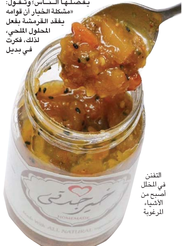
التفنن في المخلل أصبح من الأشياء المرغوبة