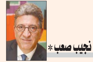
نجيب صعب *

وتهدف «مبادرة الشرق الأوسط الأخضر»، التي أطلقها ولي العهد السعودي الأمير محمد بن سلمان في نهاية شهر مارس (آذار) الماضي، إلى دعم الجهود والتعاون في المنطقة لخفض الانبعاثات الكربونية بما يمثل أكثر من 10 في المائة من إجمالي الإسهامات العالمية الحالية، وزراعة 50 مليار شجرة واستصلاح نحو 200 مليون هكتار من الأراضي المتدهورة. رغم استمرار التحديات الكبرى التي ما زالت تواجه البيئة، فتحت السنة الجديدة أبوابها على مبادرات مفعمة بالأمل.