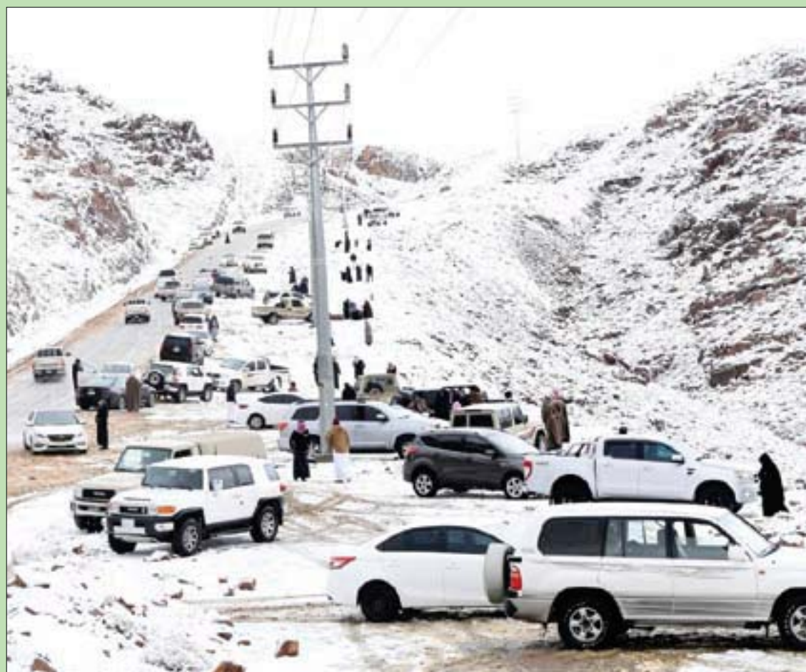
استقبل جبل اللوز في منطقة تبوك شمال غربي السعودية وعدد من المراكز التابعة لها ومحافظة طريف أول أيام العام الجديد أمس بالثلوج (واس) (تفاصيل يوميات الشرق)

حذر مجلس السيادة السوداني من فتنة في البلاد، بعد أحداث العنف التي وقعت خلال مسيرة حاشدة في الخرطوم في 30 ديسمبر (كانون الأول)، أوقعت قتلى وجرحى، إلى جانب قتلقات أمنية في دارفور، وتعديات وحوادث نهب واسعة لقر البعثة الأممية بمدينة الفاشر، مشيراً إلى وجود جهات «تعمل على زرع الفتنة والخلالات» بين مكونات الشعب السوداني. وأدان المجلس، في جلسة طارئة برئاسة الفريق عبد الفتاح البرهان أمس، تلك الانتهاكات، مؤكداً المضي قدماً في بسط الحريات، بما فيها حرية التعبير والتعبير السلمي، والالتزام بالمعايير الدولية في هذا الخصوص، مع الحفاظ على سلطة القانون وهيبة الدولة. وأكدت سلمى عبد الجبار عضو مجلس السيادة الانتقالي في تصريح صحفي أن الاجتماع ناقش الأوضاع الراهنة بالبلاد، مشيرة إلى تأكيد المجلس على ضرورة معالجة الأزمة الراهنة بالحوار والتوافق وتجسير الفوارق بين المبادرات المطروحة للخروج برؤية موحدة، وتسريع تشكيل حكومة «تكنوقراط» لسد الفراغ في هياكل الحكم الانتقالي. في غضون ذلك أعلنت لجان المقاومة بالخرطوم، وهي «تنظيمات شعبية» وكيانات نقابية تقود الحراك الشعبي، عن مظاهرة «ملبونية» اليوم، تتوجه إلى القصر الجمهوري وسط الخرطوم أطلق عليها «موكب الصدمة». (تفاصيل ص 3)