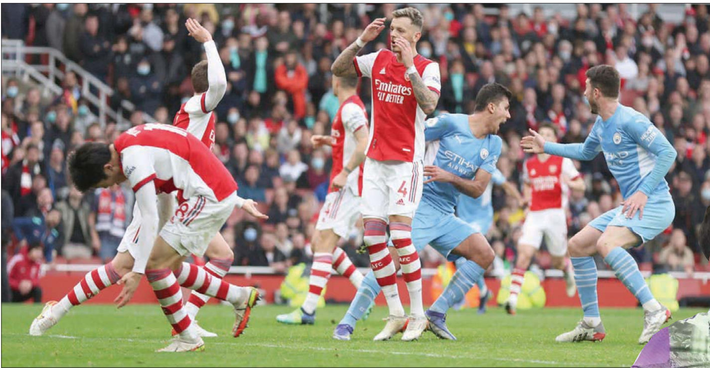
أفراح في مانشستر سيتي وأحزان في أرسنال

وعاد توتنهام بفوز ثمين في سعده لإحراز إحدى البطاقات المؤهلة إلى دوري أبطال أوروبا بتغلبه بصعوبة على واتفورد بهدف متأخر سجله مدافعه الكولومبي دافينسون سانتشيز في الدقيقة السادسة من الوقت بدل الضائع من كرة رأسية من مسافة قريبة، علماً بأن المباراة توقفت في الدقيقة 85 لفترة 5 دقائق لإسعاف أحد المتفرجين من قبل الجهاز الطبي في الفريقين قبل أن تستكمل. تسدد توتنهام الشوط الأول لكن مهاجمه لم يحسبوا استغلال الفرص التي سنحت لهم وأبرزها لهدافه هاري كين. في المقابل، ظهر واتفورد الذي يتهدده الهبوط إلى الدرجة الأولى بشكل مغاير في الشوط الثاني من دون أن ينجح لاعبه في هز الشباك. والخسارة هي السادسة على التوالي لواتفورد.