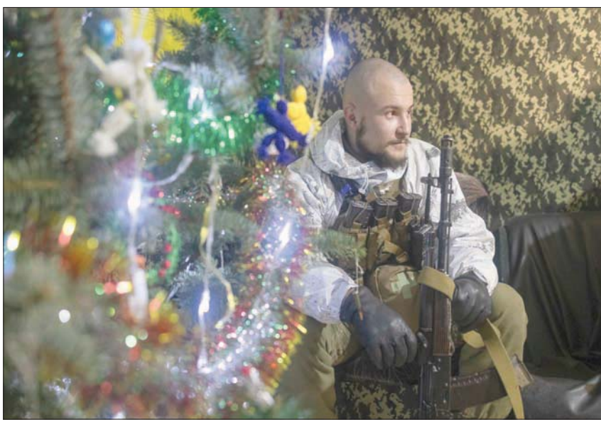
جندي أوكراني على حدود المواجهة مع انفصاليي دونيتسك في 31 ديسمبر

الأميركي الكامل لاستقلال أوكرانيا ووحدة أراضيها»، وفق ما أكد مسؤول في البيت الأبيض. وأضاف أن الرئيس الأميركي سيناكش «انتشار الجنود الروس على الحدود مع أوكرانيا، ويعرض التحضرات للاجتماعات الدبلوماسية المقبلة المخصصة لخفض التصعيد في المنطقة». من جهة، أعرب زيلينسكي في تغريدة عن تطلعه لمناقشة «سبل تنسيق خطواتنا المصلحة السلم في أوكرانيا والأمن في أوروبا» مع الرئيس الأميركي. وكان بايدن توعد بوتين برد حازم على أي اجتياح روسي لأوكرانيا، وذلك خلال مكالمة هاتفية جرت بينهما الخميس وحذر فيها الرئيس الروسي من أن أي عقوبات جديدة ضد موسكو ستكون «خطأ جسيماً». وفي ختام هذه المكالمة الهاتفية التي استغرقت 50 دقيقة، وهي الثانية في أقل من شهر، شدد الرجلان، رغم