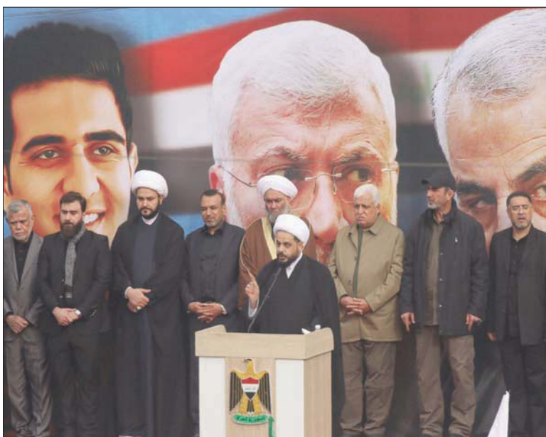
زعم جماعة «عصائب أهل الحق» قيس الخزعلي يخطب في تجمع من أنصار «الحشد الشعبي» بمناسبة ذكرى مقتل الجنرال الإيراني قاسم سليماني والقيادي في «الحشد الشعبي» أبو مهدي المهندس في بغداد أمس (رويترز)

المنفصلت، بما في ذلك السلاح الذي تملكه الفصائل المسلحة المعروفة، وعشرات الفصائل الجديدة التي أعلنت عن أسمائها وعدد من المهام التي قامت بها العام الماضي، هو وجود الأميركيين في العراق؛ داعين إلى انسحابهم من البلاد. وبالفعل، أجبرت الحكومة العراقية، برئاسة مصطفى الكاظمي، 4 جولات من الحوار الاستراتيجي مع الأميركيين، آخرها الزيارة التي قام بها الكاظمي إلى واشنطن في الخامس والعشرين من شهر يوليو (تموز) الماضي، والتي أسفرت عن توقيع اتفاق يقضي بانسحاب القوات القتالية الأميركية نهاية عام 2021. وفي بغداد، استمرت جولات المفاوضات الفنية بين ممثلين عن القوات الأميركية (بما في ذلك الزيارات المتعددة التي قام بها إلى العراق قائد القيادة المركزية الأميركية كينيث ماكنزي) وبين وفد عراقي برئاسة قاسم الأعرجي مستشار الأمن القومي،