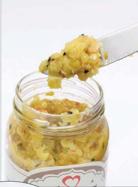
نكهات جديدة تضاف إلى المخلل بالمخارطة مع التقليدية منه

كان للزيتون ركن خاص في قائمة «خير جدتي» فهو الحبة التي يقع في حبها الملائين، لذلك، قالت أصل: «الزيتون حبة عزيزة، تغمر مطبخنا في الفترة بين شهر سبتمبر (أيلول) وحتى نهاية نوفمبر (تشرين الثاني)، ورغم قصر هذه المدة فإنه واحد من أهم أنواع المخلل، وما