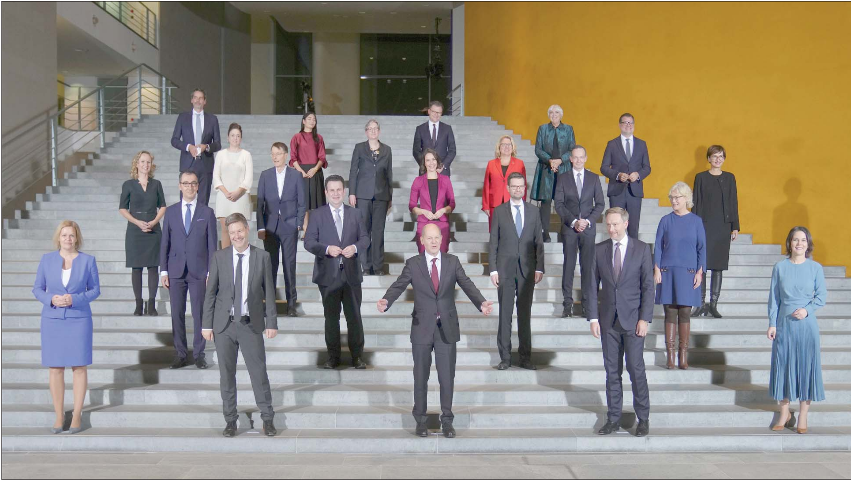
برلين، إعادة بهنام

لا تشبه الحكومة الألمانية الجديدة سابقاتها. فهي ليست حكومة ائتلافية اعتيادية مؤلفة من شريكين يتقاسمان سوية، بل هي ائتلاف واسع يضم 3 شركاء للمرة الأولى في تاريخ ألمانيا... ثم إن هؤلاء الشركاء الثلاثة لا يشبه بعضهم بعضاً بشيء تقريباً.