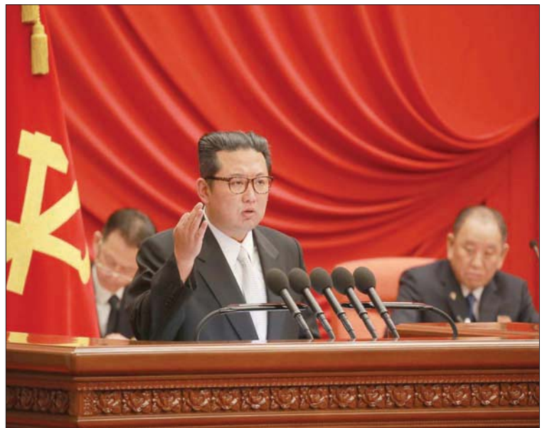
كيم جونج أون يلقي كلمة بمناسبة نهاية العام في بيونغ يانغ (د.ب.أ)

في 2022، ولا تعرف فعلاً ما ينبغي أن تقوم به (...) على صعيد السياسة الخارجية في هذه المرحلة». وحسب تقرير للامم المتحدة نُشر في أكتوبر، لم يمنع التدهور الاقتصادي الناتج عن الجائحة، بيونغ يانغ، من تطوير قدراتها العسكرية وبرنامجه للأسلحة. وفي عام 2021، أعلنت كوريا الشمالية أنها اختبرت بنجاح صاروخاً باليستياً أطلق من غواصة وصاروخ كروز طويل المدى وسلاحاً أطلق من قطار، قالت إنه مقذوفة فرط صوتية. وتوقفت المفاوضات مع الولايات المتحدة في 2019، حين فشلت قمة بين كيم جونج - أون والرئيس الأمريكي جو بايدن دونالد ترامب. ومنذ تولي جو بايدن الرئاسة الأمريكية، أعلنت الولايات المتحدة مرات عدة أنها مستعدة للقاء ممثلين عن كوريا الشمالية. إلا أن بيونغ يانغ رفضت هذا العرض حتى الآن.