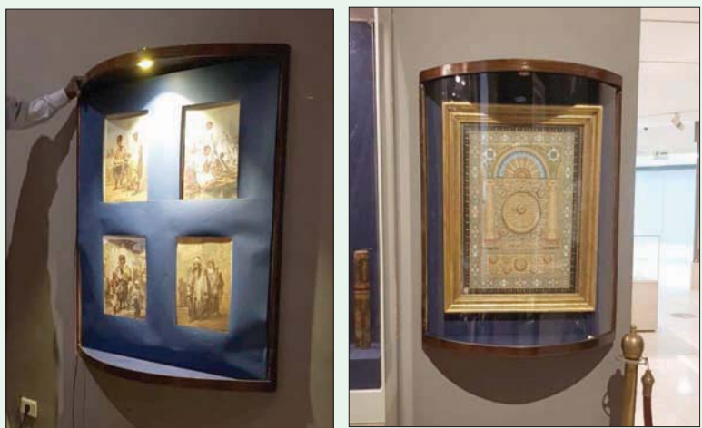
صور قديمة نادرة في المعرض