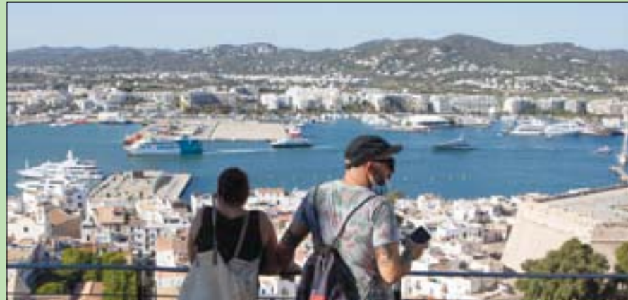
جزيرة حافظت على مناطق بكر رغم الازدهار السياحي

الاستكشاف في إبيزا وهي: إس كالدو دي سيبا، وسا تالابيا، وموسكارتين لايت هاوس، وإس بورتيتشول.