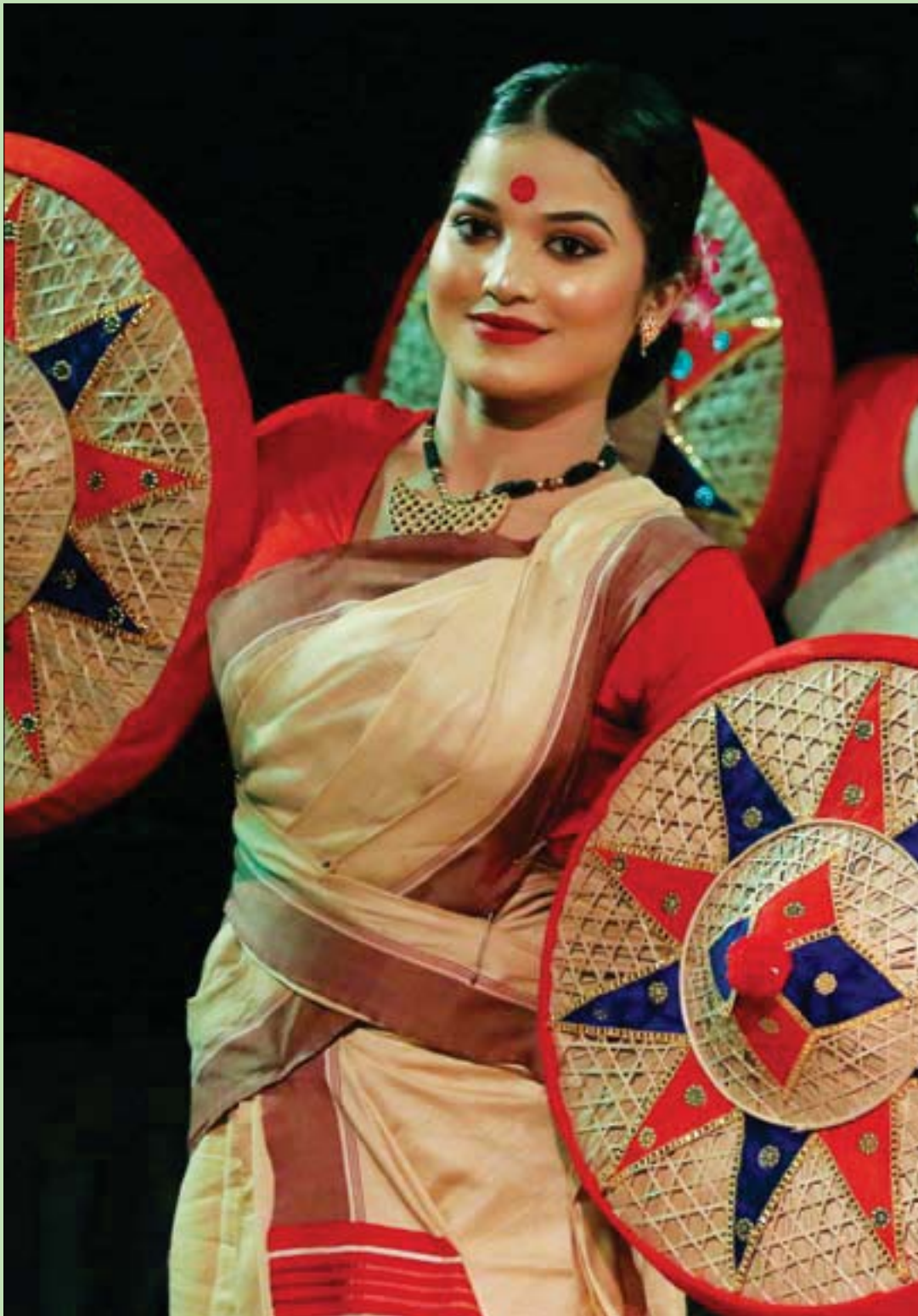
فنانة هندية تؤدي رقصة «بيهو» التقليدية خلال احتفام مهرجان لوكرانج في غايبور الهندية

أما بالنسبة للعمل نصف يوم في (يوم الجمعة)، فلا حرج في ذلك لأنه جاء في إحدى الآيات الكريمة، وقف العمل حتى منتصف النهار على الأقل، ولهذا الهدف تحديداً قال الله عز وجل: (يا أيها الذين آمنوا إذا نودي للصلاة من يوم الجمعة فاسعوا إلى ذكر الله وذروا البيع ذلك خير لكم إن كنتم تعلمون فإذا قضيت الصلاة فانتشروا في الأرض وابتغوا من فضل الله واذكروا الله كثيرا لعلكم تفلحون) - الآية - صدق الله العظيم. اعتقد أن الآية الكريمة واضحة ولا تحتاج إلى تفسير - أو (فركلات).