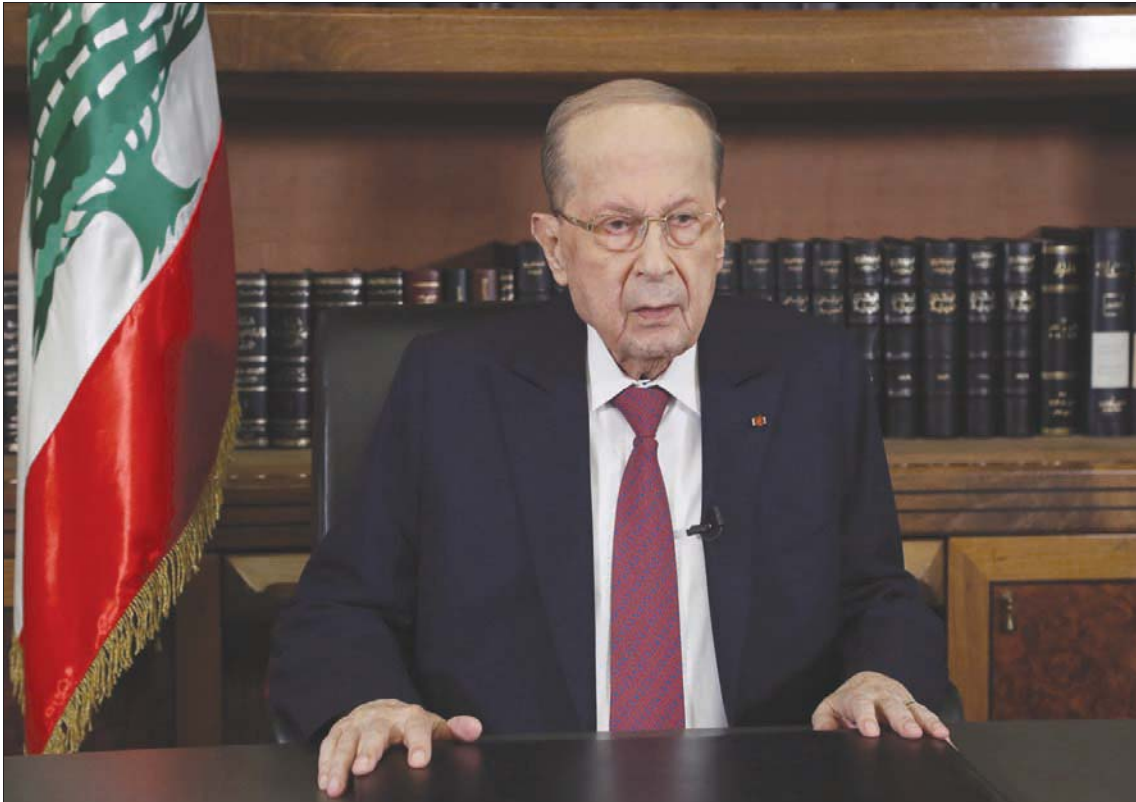
الرئيس عون خلال توجيه كلمة إلى اللبنانيين أمس (الداخلي ونهر)

لمتلقى حوار الثقافات، وليس أرض الصراعات». ودعا إلى توقف التعطيل المتعمد والممنهج وغير المبرر، الذي يؤدي إلى تفكيك المؤسسات وانحلال الدولة، وإلى ضرب المجلس الدستوري، وأسقط خطة التعافي المالي وعطل الحكومة والنواب والتفكيك والانحلال نحرا القضاء»، وشدد على ضرورة أن تجتمع الحكومة سائلاً: «بأي شرع أو منطق أو دستور يتم تعطيلها؟» كما انتقد رئيس البرلمان نبيه بري من دون أن يسميه قائلاً: «لماذا لا يتجاوز مجلس النواب مع دعواتي المتلاحقة إلى إقرار قوانين لخدمة الناس وهل مكان هذه القوانين في الإدراج واللجان فقط؟» مشدداً على أن «الدولة تبني باحترام القوانين وليس بتجاوز السلطة ولا بهيمنة سلطة على سلطة أخرى».