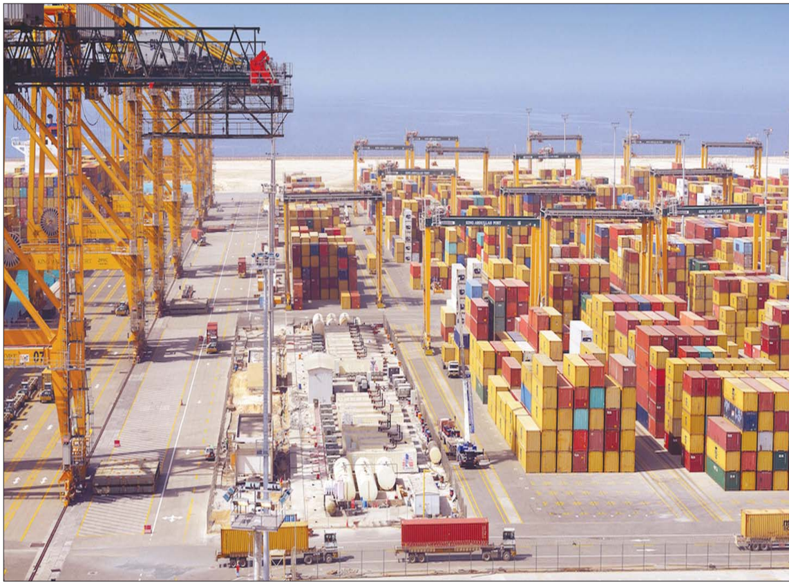
إلزام العمل طوال اليوم في الخدمات بالموانئ السعودية (الشرق الأوسط)

وكانت «موانئ» قد وجهت المعنيين مؤخراً بضرورة العمل على تقديم المناقشات عبر منصة «فسح» - نافذة إلكترونية للاستيراد والتصدير - قبل وصول السفينة بـ 72 ساعة