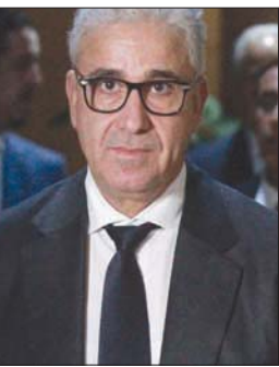
المرشح الرئاسي فتحي باشاغا

ومناطق يتمتعون فيها بحفظ منساقية، من حيث النقل القبلي والجهوي». كما حذر القمطاني من أن «تزايد شكوك الليبيين في دور مفوضية الانتخابات ومؤسسة القضاء، وتوظيفها سياسياً لاستبعاد مرشحين بعينهم لصالح منافسين آخرين، قد يفقد الثقة بالعملية الانتخابية برمتها، ويخسر الجميع فرصة التغيين». من جهته، أكد رئيس الهيئة العليا القوي لـ«تحالف الوطنية»، توفيق الشهيدي، أن الشعب الليبي «قد يكون مهتماً بخسارة أي أمال متبقية له في إجراء الانتخابات، إذا ما قدم مجلس المفوضية الحالي اقتراحات»، وسبب ما يتعرض له من انتقادات». وأوضح الشهيدي في تصريح لـ«الشرق الأوسط» أن وجود مجلس جديد للمفوضية