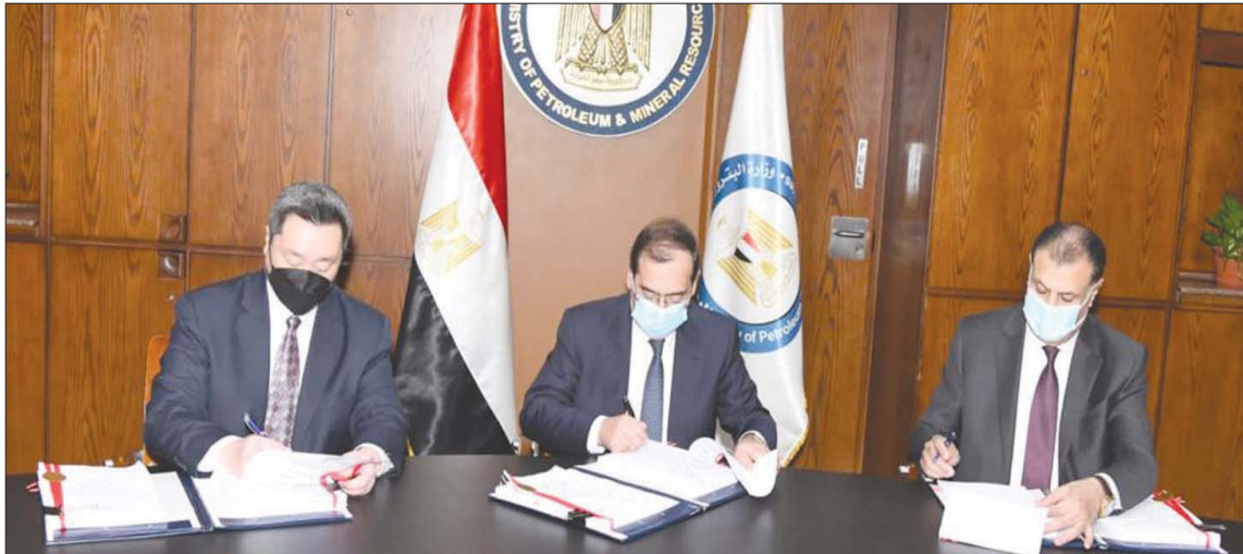
جانب من توقيع اتفاقية التنقيب والاستكشاف لأباتشي الأميركية في مصر

أوضح الوزير في بيان أمس، أن هذه الاتفاقية تأتي «في إطار جهود التطوير والتحديث المشتركة بين الجانبين من خلال دعم مناطق امتياز شركتي خالدة وقارون للبترول القائميتين بالعمليات نيابة عن هيئة