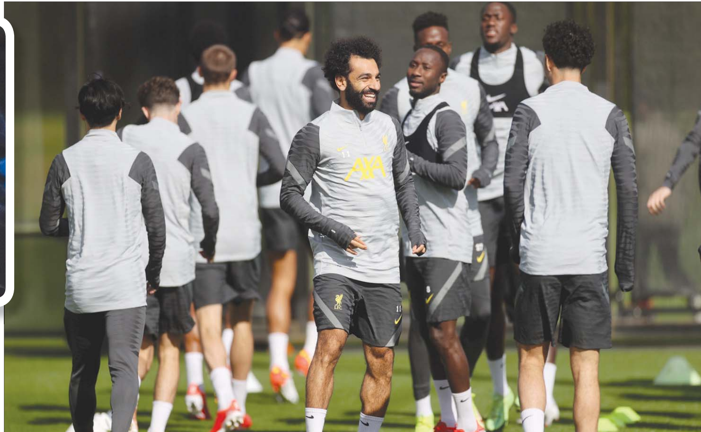
صلاح يتوسط لاعبي ليفربول خلال التدريبات استعداداً لمواجهة ليستر