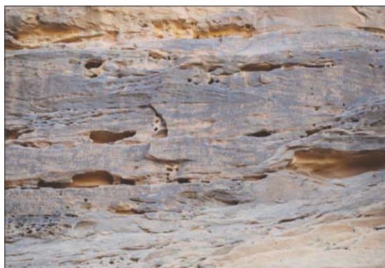
تختلف طبيعة النقوش ما بين البارز والحفر بحسب ما تفيد الراوية الجهني

التي أنشئت سنة 1945، الخان والمسجد والمسرح وقصر الثقافة، وفق أبو سعدة، الذي أوضح في تصريحات لـ«الشرق الأوسط» أنّ «القرية كان بها الكثير من المشكلات بسبب مرور الزمن وهو ما استدعى التدخل لترميمها بوصفها مسجلة على قائمة التراث المعماري في الجهاز القومي للتنسيق الحضاري». وحسب أبو سعدة فإن منظمة اليونسكو تُعد القرية من العمارة التقليدية التي تعد جزءاً من العمارة الحديثة، ومن هنا جاءت المطالبة بتسجيل القرية على قائمة التراث المادي باليونسكو، مشيراً إلى أنّ «الجهاز سيبدأ بالتعاون مع اليونسكو الإعداد