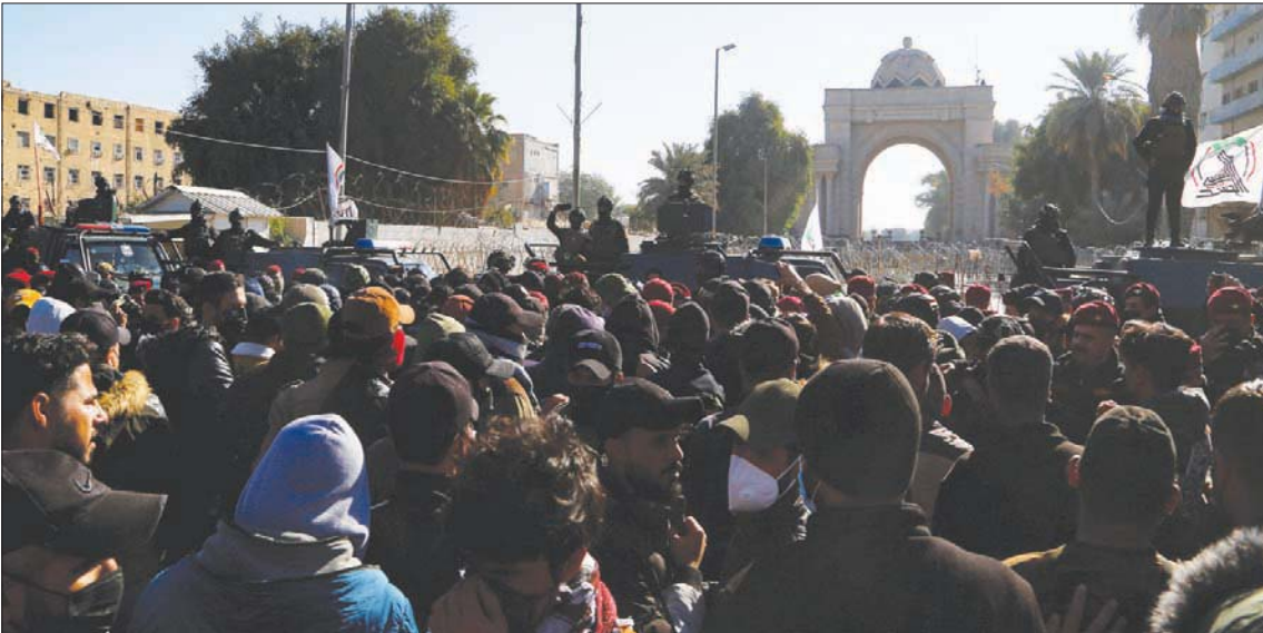
محتجون ضد نتائج الانتخابات أمام المحكمة الاتحادية العليا في بغداد أمس

بصعوبة بالغة تخطلت المحكمة الاتحادية العليا في العراق المحنة التي وضعتها فيها القوى السياسية في البلاد، بعد أن ألقت في ملعبها كرة خلافاتها وإخفاقاتها طوال الثمانية عشر عاماً الماضية. ففي ظل أوضاع استثنائية استمرت أكثر من شهرين، قوامها طعون وشكوك ومظاهرات واعتصامات وتهديدات باقتحام المنطقة الخضراء؛ حيث مقرات مفوضية الانتخابات ومحكمة القضاء الأعلى والمحكمة الاتحادية، صادقت المحكمة، أمس، على نتائج الانتخابات التي أجريت في 10 أكتوبر (تشرين الأول). كما ردت الطعن المقدم من تحالف الفتح، بزعامة هادي العامري، الخاص بإلغاء نتائج الانتخابات.