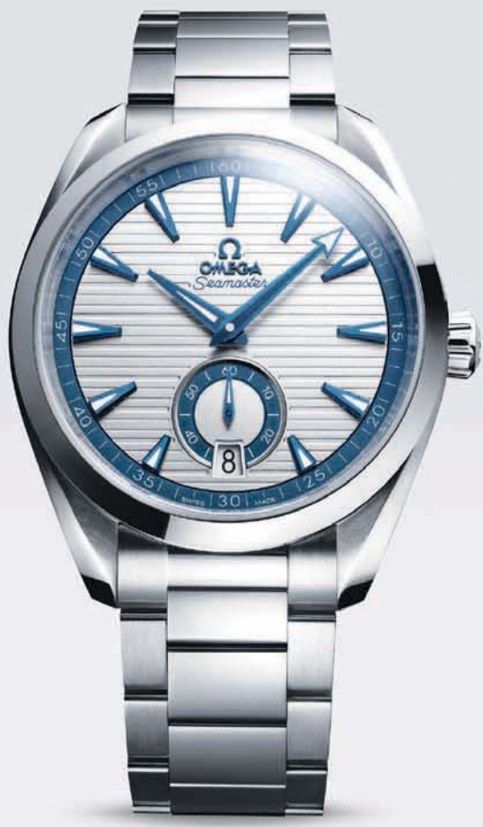
SEAMASTER AQUA TERRA

As its name suggests, the Aqua Terra crosses many boundaries. Developed from a long line of ocean-watches, it shares DNA with our most rugged sports chronometers, yet is infused with the design sensibility of a classic dress watch. Continuing that spirit, today's Co-Axial Master Chronometer models are tested and certified at the highest level by the Swiss Federal Institute of Metrology (METAS). This guarantees more accuracy, reliability and supreme resistance to magnetism from electronic devices, such as phones and laptops, making the Aqua Terra the ultimate everyday watch.