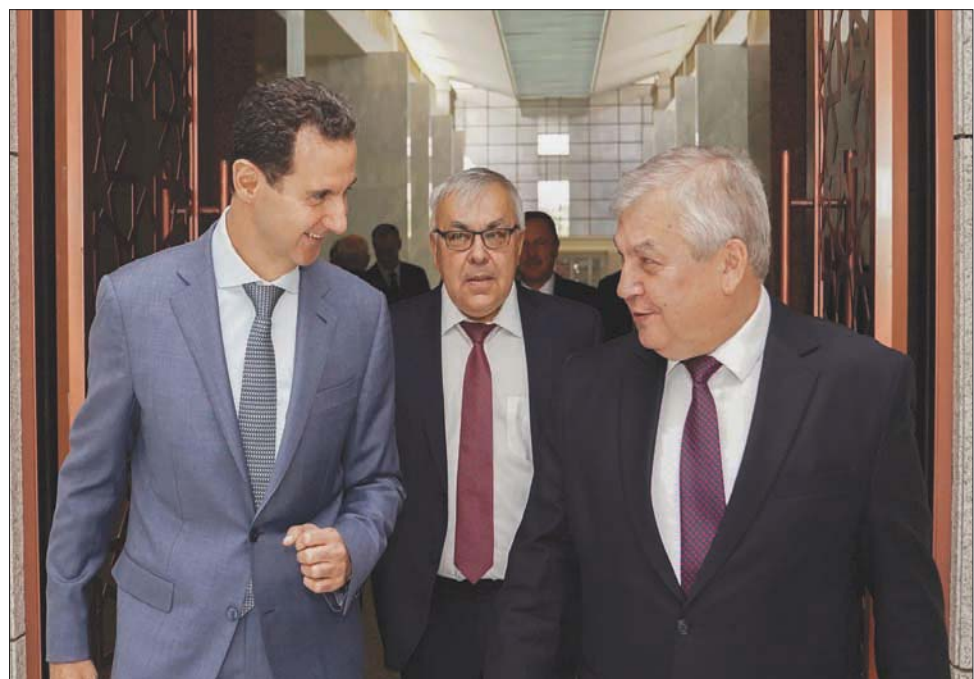
صورة وزعتها وكالة «سانا» لاجتماع الرئيس بشار الأسد بالمبعوث الروسي الكسندر لافرنتييف ونائب وزير الخارجية الروسي سيرغي فيرشينين (وسط، في دمشق 17 أكتوبر الماضي (إب.أ))

بلاده «لم يتغير»، واصفاً الآلية العابرة للحدود بأنها «غير شرعية». وشدد على أن «كل المساعدات التي تصل إلى سوريا يجب أن تدخل عبر السلطات الشرعية».