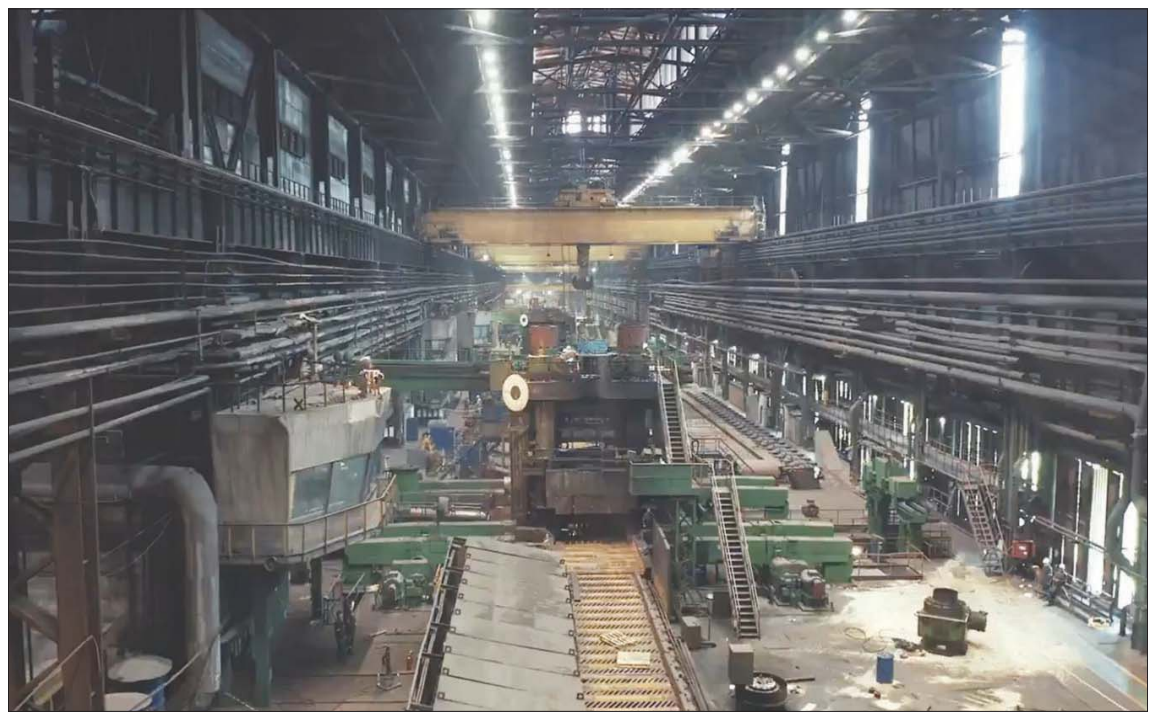
تسجيل أعلى عائد تاريخي لقطاع التعدين في السعودية (الشرق الأوسط)

تنفيذ الجولات الرقابية للتأكد من متابعة الأنشطة التعدينية وضمان حماية القطاع من الممارسات غير النظامية والمحافظة على الثروات المعدنية لتحقيق الاستغلال الأمثل لها وحماية المجتمعات المجاورة، إضافة إلى تطبيق لائحة نظام الاستثمار التعديني بما يحقق استدامة القطاع. وأشارت إلى أن المخالفين في منطقة الرياض يشكلون النسبة الكبرى من إجمالي العقوبات الصادرة بنحو 30 عقوبة، تليها المنطقة الشرقية بـ 21، ثم القصيم بـ 16، ومكة المكرمة بـ 14 عقوبة. وتعمل وزارة الصناعة والثروة المعدنية على حماية قطاع التعدين وتحقيق أهدافه الرئيسية المتمثلة في تنويع مصادر الدخل الوطني وتنمية الإيرادات غير النفطية، علاوة على تعظيم القيمة المحققة من الموارد المعدنية الطبيعية في المملكة، من خلال الاستغلال الأمثل للثروات المعدنية بما يحقق جاذبية القطاع للاستثمار وتحويله ليكون الركيزة الثالثة للصناعة الوطنية وفق مستهدفات رؤية المملكة 2030.