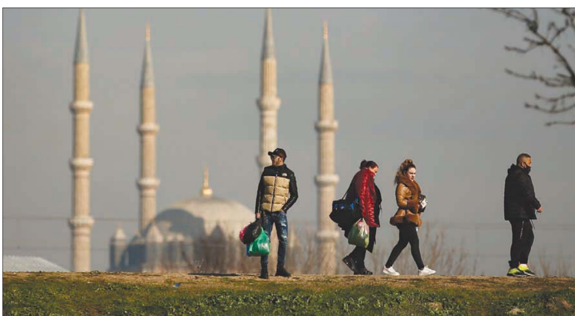
واصلت الليرة التركية أداءها المتذبذب مقابل الدولار في بداية تعاملات الأسبوع (أب)

وتتيح الأداة المالية التركية الجديدة للمودعين تحقيق نفس مستوى الأرباح المحتملة للمدخرات بالعملات الأجنبية عبر إبقاء الأصول بالليرة التركية. وكانت الليرة تراجعت لمستويات قياسية سابقاً بضغط من تخفيضات البنك المركزي المتتالية لأسعار الفائدة. وفي غضون ذلك، وافقت السلطة المسؤولة عن تنظيم عمل المصارف في تركيا على