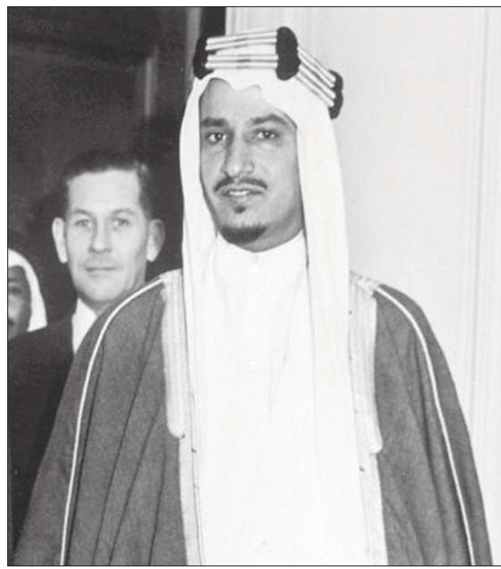
الملك خالد بن عبد العزيز

استكمل سعود الفيصل فضولاً جديدة في تاريخ الخارجية السعودية، وشهدت المرحلة اضطرابات وتحولات عربياً وإقليمياً ودولياً، اختصرها الأمير سعود الفيصل في تصريحه لصحيفة «نيويورك تايمز» عام