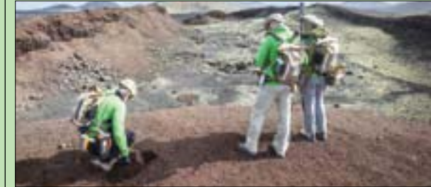
دراسة بتروغرافية كشفت أصل الأواني الخزفية

الإلكتروني ملخصاً عنها أخيراً. وباستخدام أداة تعرف باسم «مطياف الانبعاث الذري للبلازما المقترن حثياً (ICP - AES)، وهو تحليل طيفي للانبعاشات يحدد النسبة المئوية الكتلية للمعادن في المركبات النانوية المعدنية - البيوليمرية، حلل الباحثون مجموعة مختارة من العينات الخزفية التي وجدت في مصر القديمة خلال عصر بناء الأهرامات، وقرنتوها مع البيانات المنشورة عن المنتجات الخزفية القديمة التي تنتمي لنفس الفترة من منطقة جيبيل، وأكدت النتائج أن المنتجات التي استوردتها مصر جاءت من نفس الصخور الأساسية بمنطقة جيبيل، ويدعم ذلك أدلة جديدة من لبنان تشير على الأرجح إلى أن بعض السفن القديمة كانت تنتمي إلى ورشة إنتاج متخصصة في صواحي جيبيل، وتم تصنيعها في جيبيل (شباط) المقبل «مجلة العلوم الأثرية»، ونشر موقعها