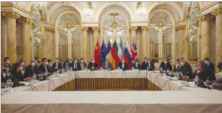
صورة ورعتها اللجنة المشتركة الخاصة بالاتفاق النووي الإيراني لجلسة انطلاق الجولة الثامنة من المفاوضات في فندق كوربوغ فيينا أمس

لقاءات ثنائية وثلاثية بين الأطراف المشاركة، كان أبرزها لقاء جمع بين رئيس الوفد الإيراني ورئيس الوفد الفرنسي المغاوض فليب إيريرا. وكانت تلك المرة الأولى التي يجتمع فيها الطرفان من دون ممثلين بريطانيا وألمانيا. وجاء الاجتماع الذي نشرته مواقع إيرانية مقربة من الوفد الإيراني صورة له، على خلفية انتقادات وجهتها طهران لباريس تحديداً واتهمتها بالتصلب في مواقف وعدم اتخاذ مواقف بناءة في المفاوضات.