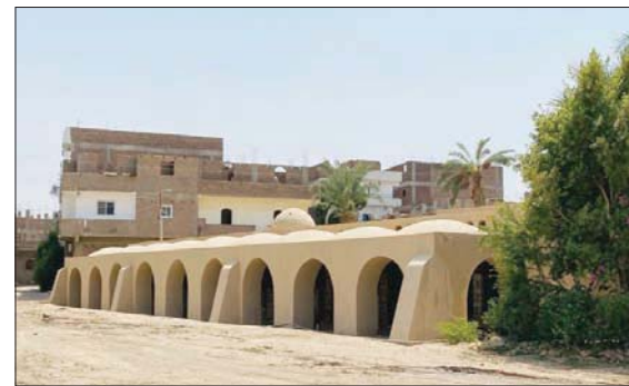
القرية تعاني من زحف المباني الخرسانية (الشرق الأوسط)

«إعادة إحياء قرية حسن فتحي، مؤسس مدرسة عمارة الفقراء في مصر والعالم، تعد حدثاً عالمياً يعكس مظاهر قوة مصر الناعمة، وتعتبر عن أحد محاور استراتيجية عمل وزارة الثقافة في الحفاظ على التراث، من خلال التعاون مع اليونسكو لترميم وتطوير ذلك النموذج المعماري الفريد لتعود القرية مصدراً للإشعاع الفني والإبداعي»، حسب تصريحات الدكتورة إيناس عبد الدايم، وزيرة الثقافة المصرية، في كلمتها في أثناء افتتاح القرية، والتي أعلنت خلالها تكليف المهندس محمد أبو سعدة، رئيس الجهاز القومي للتنسيق الحضاري، «بإعداد ملف عن قرية حسن فتحي للتسجيل على قائمة التراث العالمي باليونسكو». وشملت المرحلة الأولى من مشروع ترميم قرية حسن فتحي