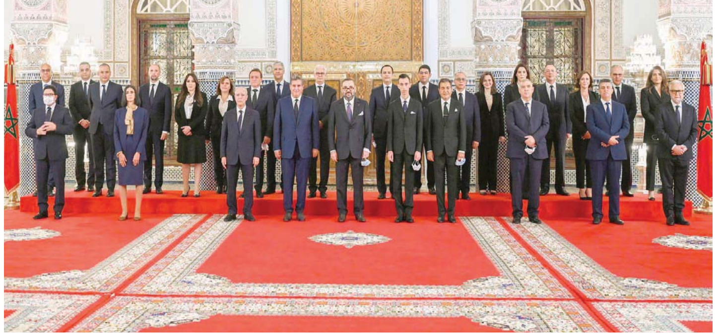
الملك محمد السادس مع الحكومة المغربية الجديدة في 7 أكتوبر الماضي