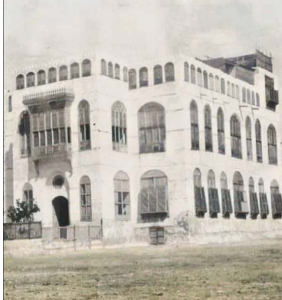
أول مبنى لوزارة الخارجية السعودية في مدينة جدة

أما المقر الرئيسي لوزارة الخارجية، فقد انتقل من مبنى الحميدية في مكة إلى جدة وتعددت الروايات حول سبب الانتقال، وشغلت بيت البغدادى في حارة الشام، وبيت درويش في حارة البحر، ثم انتقلت بعد ذلك إلى بناية باطولي الواقعة على شارع المطار القديم. وحين انتقل المقر إلى مبنى الوزارة الواقع أمام (بحيرة الأريحيين) في صيف عام 1955م كان عدد موظفي ديوان الوزارة بجدة لا يتعدى 50 موظفاً وميزانيتها 21 مليون ريال. لكن المبنى أصبح أحد أبرز معالم جدة، وتصدرت صورته العملة السعودية من فئة الريال في الستينات الميلادية.