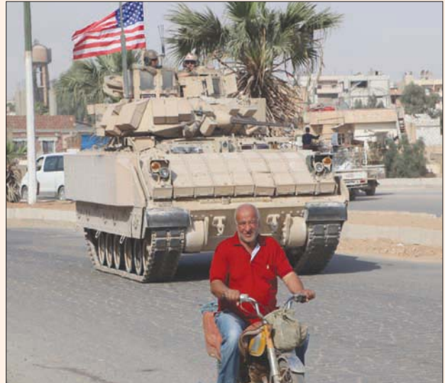
دورية أميركية في تل تمر بريف الحسكة

المنطقة بالعداوات والصواريخ، بعد ذهاب الدورية الأميركية بساعات وطال القصف قرى الكوزلية والطويلة وتل أطول الأثورية وقرية الدردارة، وتشهد هذه المناطق الواقعة على خطوط