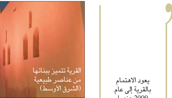
القرية تتميز ببنايتها من عناصر طبيعية (الشرق الأوسط)

يعود الاهتمام بالقرية إلى عام 2009 عندما بدأت اليونسكو مشروعاً بالتعاون مع وزارة الثقافة لتطويرها، وأجرت دراسة على القرية عام 2010 رصدت فيه 59 مبنى من عمارة حسن فتحي