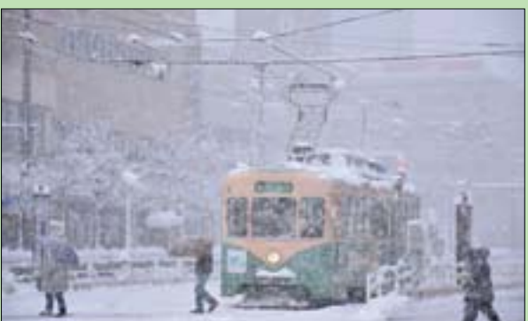
شارع في مدينة توياما اليابانية تغطي ثلوج كثيفة

طوكيو: «الشرق الأوسط» في وسط اليابان وغربها، تسبب التساقط الكثيف للثلوج بزحمة سير، وإلغاء رحلات جوية، وتعطل حركة القطارات أمس الاثنين، في حين شهدت بعض المناطق معدلات قياسية لهطول الأمطار، حسب وكالة الصحافة الفرنسية، وكانت الكهرباء قد انقطعت عن نحو 1500 منزل الإثنين نحو الساعة الخامسة مساءً بتوقيت غرينتش، حسب ما قال المسؤول عن شركة «كانساي» للطاقة الكهربائية عبر موقعها الإلكتروني. وأعلن الناطق باسم الحكومة اليابانية هيروكارو ماتسونو صباحاً أن أي إصابات من جراء سوء الأحوال الجوية لم تسجل، مؤكداً الحاجة إلى «زيادة الحذر واليقظة».