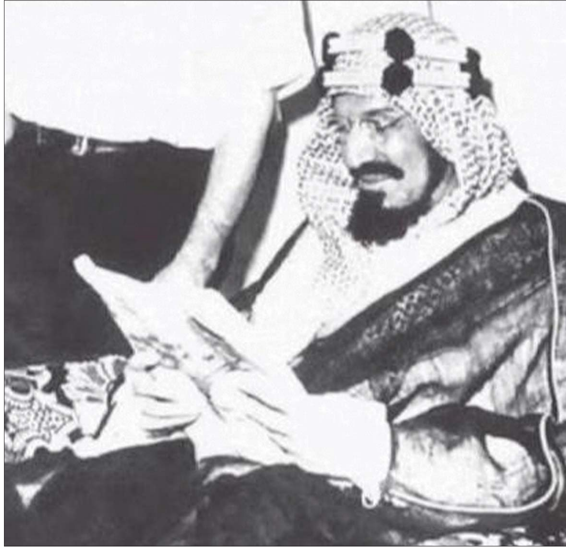
المؤسس الملك عبد العزيز بن عبد الرحمن

السعودية ممثلة بوزير خارجيتها (الملك) الأمير فيصل من الدول المؤسسة لهيئة الأمم المتحدة عام 1945م، كما أعيدت صياغة المشهد الإقليمي فتأسست جامعة الدول العربية في العام نفسه، وسعت السعودية من خلال وزارة خارجيتها إلى دعم استقلال الدول العربية ومناصرة القضية الفلسطينية، وكان هناك حالة من عدم الاستقرار في العالم العربي، علاوة على الحرب الباردة، فتبنى الملك فيصل دعوة التضامن الإسلامي وتأسست منظمة المؤتمر الإسلامي عام 1969م، وكان آخر الملفات الكبرى لتلك المرحلة محاولات إيجاد حل عادل للصراع العربي الإسرائيلي بعد حرب أكتوبر (تشرين الأول) 1973م، وقرار حظر النفط المصاحب لها، فقد توفي وزير الدولة للشؤون الخارجية عمر السقاف في نيويورك وهو يشارك في اجتماعات الجمعية العامة للأمم المتحدة لمناقشة هذه القضية في نوفمبر (تشرين الثاني) 1974م، تلى ذلك اغتيال الملك فيصل، وهو يستقبل في مكتبه وزير النفط الكويتي في مارس 1975م، وبذلك طويت فصول لم يُدون أكثرها من تاريخ الوزارة المدافعة عن الحقوق العربية والإسلامية والساعية إلى دعم الأمن والسلم في العالم.