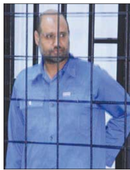
سيف الإسلام القذافي

فإن الولايات المتحدة التي تصفه كحليف للروس لن تتوانى عن تقديم المساعدة في تسليمه، وهو أمر محتمل جداً في ظل عدم امتلاكه لأي ميليشيا مسلحة». وأرجع القمطاني في تصريح لـ«الشرق الأوسط»، ذلك إلى «التقارب في مشاريعهم السياسية، وتنافسهم في مدن