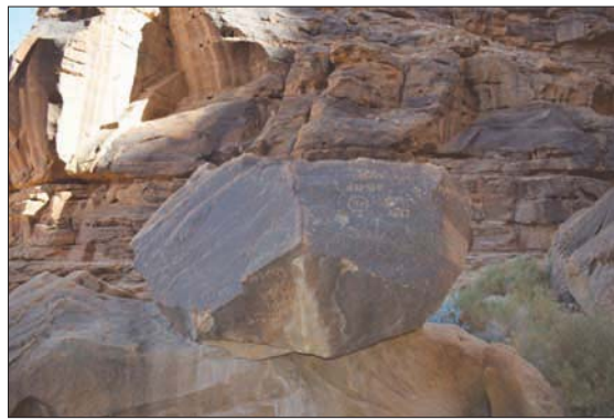
نقوش أثرية على جبل عكمة تُظهر اهتمام العرب القدامى بالفنون

كل هذه الرسائل التي تركزت بلغة الماضي، الهمت الباحثين لتتبع أصول اللغة العربية الحديثة. وبينما يتغمس الزائر في الكنوز المنقوشة على الحجر التي تضم نصوصاً في تفاصيل القرابين والقوانين، إلى جانب النقوش المذهلة ثلاثية الأبعاد التي تزين هذا المكان الفريد، فلا بد له أن يندبش كذلك من قوة جبل عكمة في الماضي والحاضر. حين كان الحجاج المتدينون يُحضرون القرابين لإلهتهم تاركين وراءهم أوصافاً لإحياء ذكرى هباتهم وتغانيهم. وعند زيارة هذا الموقع الأسر، تزداد متعة تأمل هذه النقوش التي نقشها سكان العلا السابقيون، وتخيّل مدى رفعة مكانة جبل عكمة، فهو مكان ذو أهمية طقسية وروحية في العصور القديمة، ومساحة مدهشة لتلهم الزوار إلى اكتشاف أسرار التاريخ ورهافة الحياة آنذاك.