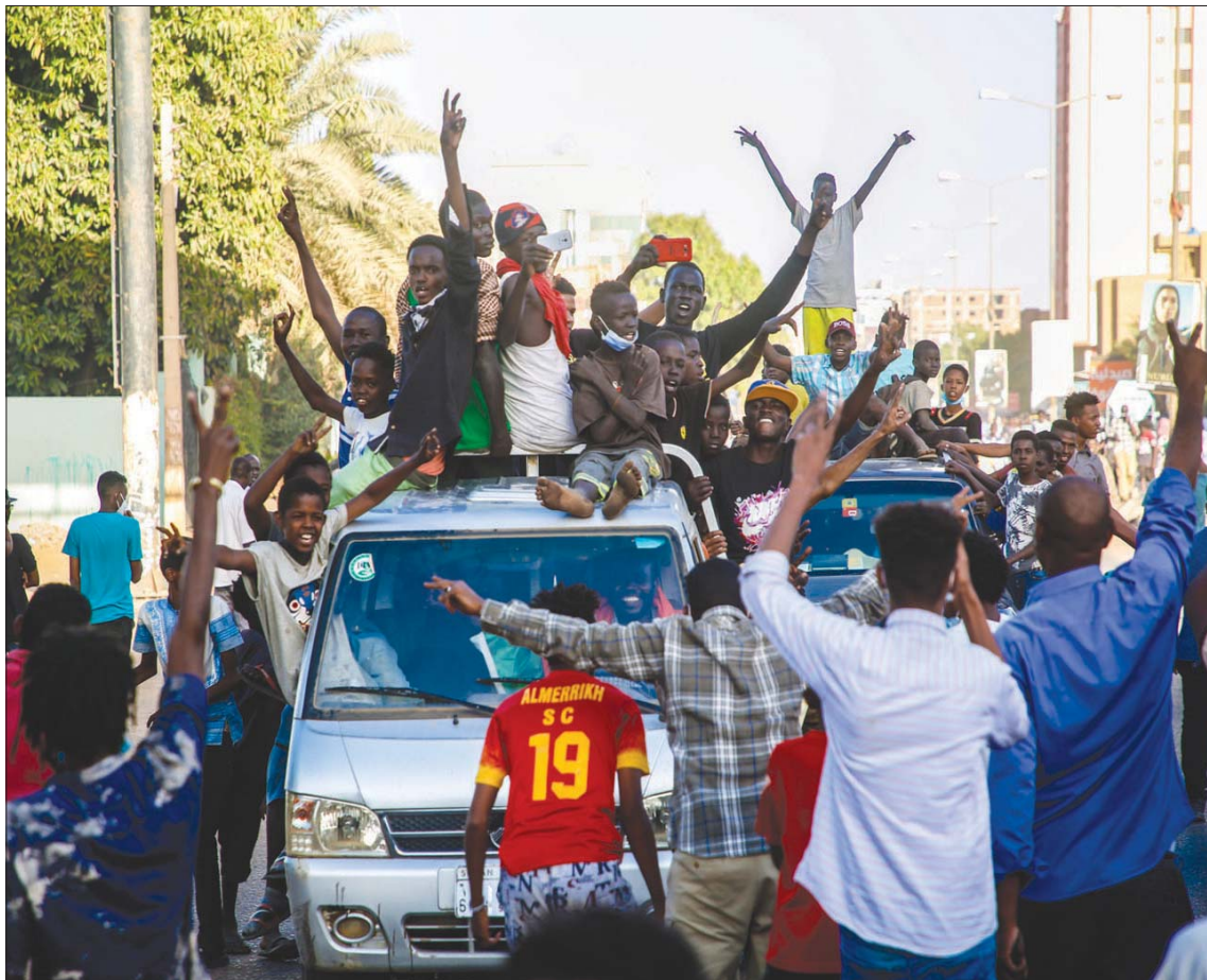
اتفاق حمدوك والبرهان في الشهر الماضي يجد رفضاً من غالبية القوى السياسية

وقال مصدر موثوق من مكتب رئيس الوزراء لـ«الشرق الأوسط» إن العاملين في مكتبه تلقوا توجيهاً بـ«الاستعداد لإجراءات تسليم وتسليم»، وإنهم سرعوا بالفعل في إجراءات تسليم الملفات للأمانة العامة لمجلس الوزراء، لكن المصدر لم يكشف الموعد المحدد الذي يُتَظَنر أن تُعلن فيه الاستقالة رسمياً.