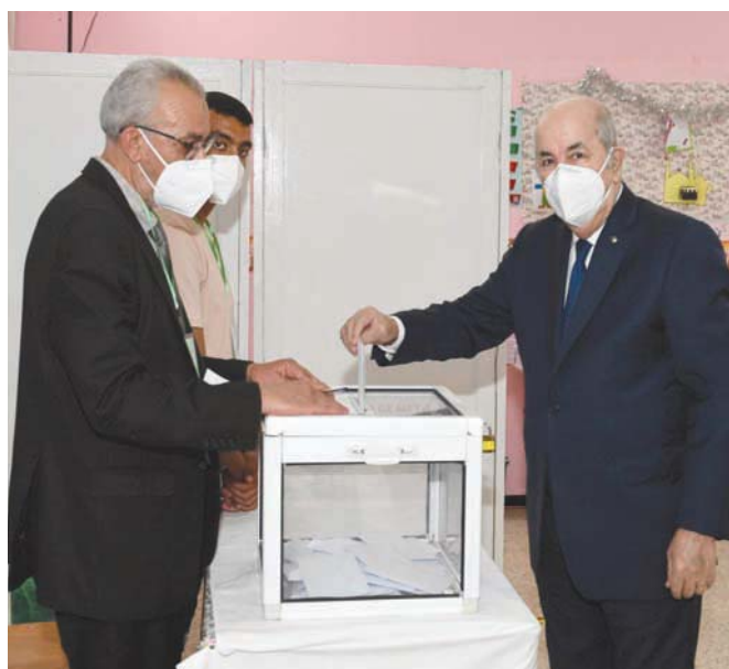
الرئيس الجزائري عبد المجيد تبون يذلي بصوته في انتخابات 12 يونيو (رويترز)