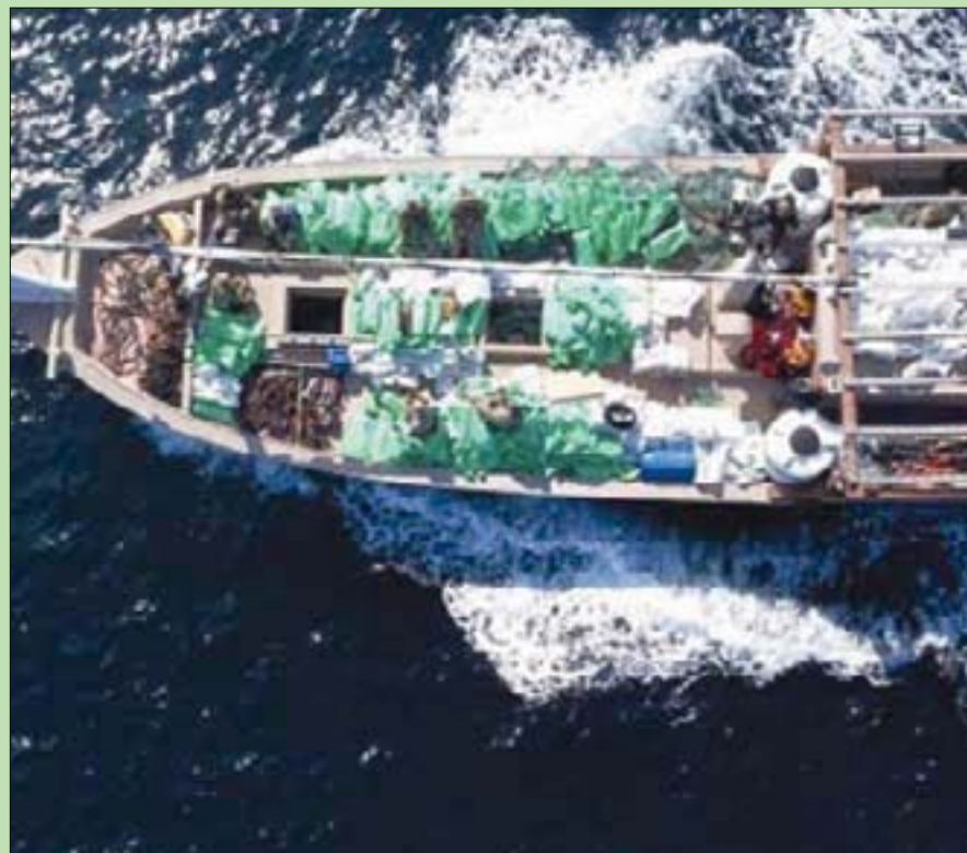
قارب يحمل أسلحة مهربة باتجاه الحوثيين أوقته البحرية الأمريكية قبل أيام في شمال بحر العرب