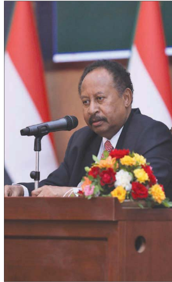
رئيس الوزراء السوداني عبد الله حمدوك

الامة القومي»؛ إن الأوضاع في البلاد متازمة، ولا بد للخروج من هذا النفق من الحوار بين كل أطراف المجتمع السوداني. وبحسب مصادر حزبية متطابقة، تحدثت لـ«الشرق الأوسط»، هذه الحركات وسط القوى السياسية لا تنفصل عن المساعي المستمرة التي تتوحد بها دوائر في الداخل والخارج، لثني رئيس الوزراء عن تقديم