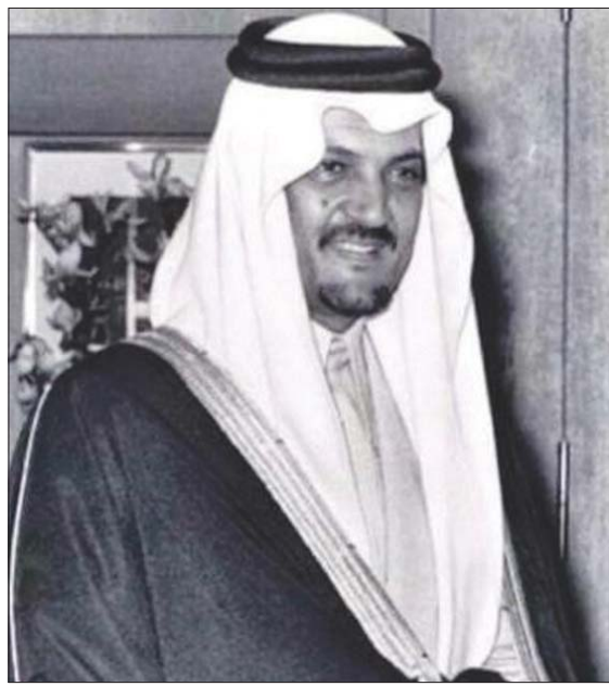
الأمير سعود الفيصل

تولى الملك خالد مقاليد الحكم في 25 مارس 1975م، وأصدر يوم 28 مارس 1975م أمراً ملكياً حول