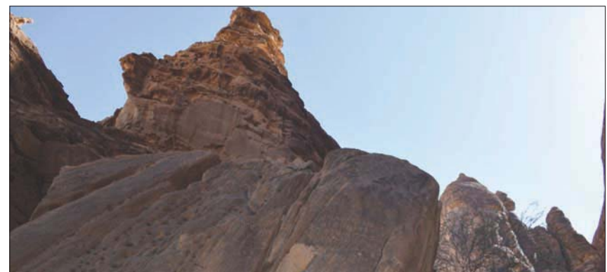
تختلف طبيعة النقوش ما بين البارز والحفر بحسب ما تفيد الراوية الجهني

يصور لنا أصحاب هذه النقوش، مشاهد من حياتهم الاقتصادية، والسياسية، والدينية، والاجتماعية. كما يصورون العديد من الزكوات التي كانوا يقدمونها لإله الليحانيين، الذي عُرف باسم (ذي غيبة)