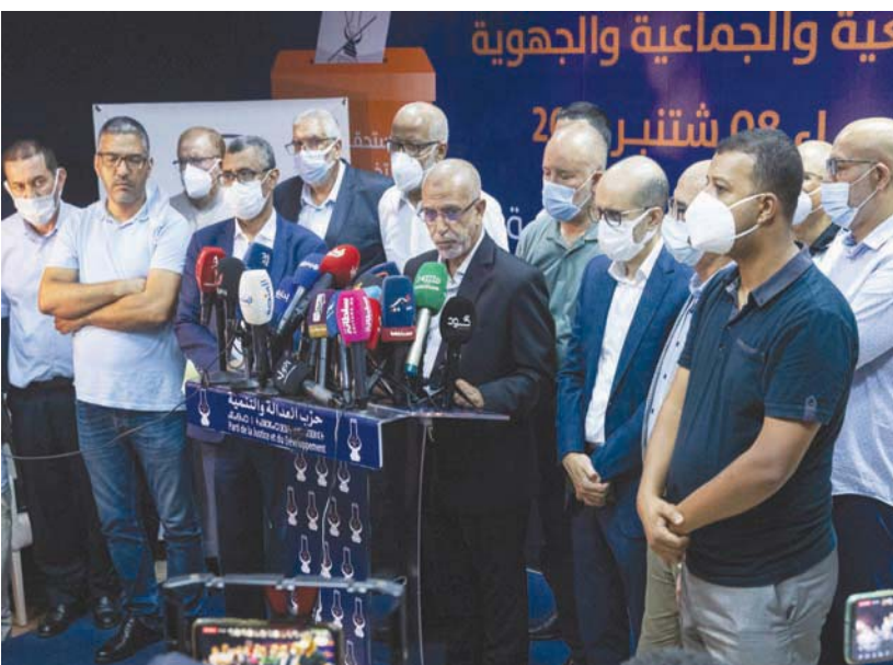
قياديون في «العدالة والتنمية» المغربي يعلنون استقالة رئيسه سعد الدين العثماني

مصادر إسرائيلية رسمية. لكن هذه العلاقات أخذت أبعاداً أكبر منذ زيارتي لبعد وغانتس في نوفمبر (تشرين الثاني) الماضي، إذ جرى التوقيع في أغسطس (آب) 2021 على اتفاقيتين بين لبعد ونظيره المغربي ناصر بوريطة، لتعميق التعاون وتعزيز العلاقات، ومذكرة تفاهم لإحداث آلية للتشاور السياسي. وشملت الاتفاقيات الأولى التعاون في مجال الثقافة والرياضة والشباب وتعزيز وتطوير العلاقات الثنائية والتعاون بشأن الخدمات الجوية بين البلدين. وفعلاً، انطلقت رحلات تجارية مباشرة بين البلدين في 25 يوليو (تموز) الماضي. واستأنفت زيارة غانتس للرباط باهتمام إعلامي كبير، لأنها الأولى لوزير دفاع إسرائيل للمغرب. وجرى خلالها التوقيع على مذكرة تفاهم في مجال التعاون العسكري والأمني، وهو الأول من نوعه بين إسرائيل ودولة عربية. وترسم مذكرة التفاهم التعاون الأمني بين المغرب وإسرائيل بـ«مختلف أشكاله» في مواجهة «التهديدات والتحديات التي تعرفها المنطقة». بحسب ما قال الجانب الإسرائيلي. وستتيح هذه المذكرة للمغرب اقتناء معدات عسكرية إسرائيلية عالية التكنولوجيا، إضافة إلى التعاون في التخطيط العملي والمالي والتطوير. لكن هذا التطور في العلاقات مع إسرائيل، وكسب مطار الرباط موقفاً أميركياً داعماً لقضية الصحراء المغربية، أثاراً حفيظة الجزائر التي اتخذت سلسلة من المواقف المتشددة تجاه المغرب، وصلت حد التهديد بالحرب. ولا تخفي الجزائر دعمها لـ«جبهة البوليساريو» التي تطالب بانفصال الصحراء عن المغرب، وتأوي مقاتليها في مخيمات تندوف (جنوب شرقي الجزائر) وتزودهم بالسلاح والعتاد، كما أنها تجد دبلوماسيتها في المحافل الدولية للدفاع عما تصفه بـ«حق الشعب الصحراوي في تقرير المصير».