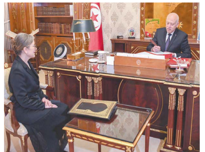
الرئيس التونسي قيس سعيد ورئيسة الوزراء نجلاء بouden في 11 أكتوبر الماضي