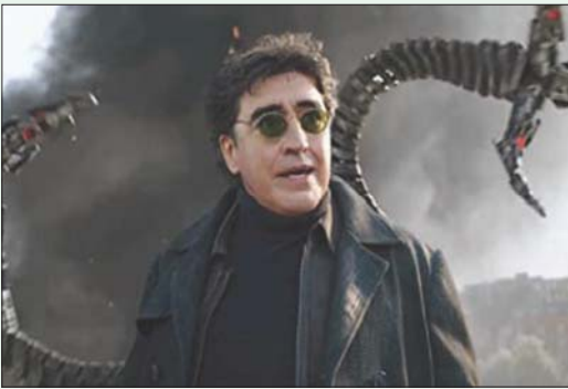
بالم سبرينغز (كاليفورنيا) محمد رضا

في العام المقبل يكون قد مرت 20 سنة على إطلاق «سبايدر مان» كما حققه سام رامبي. وما يلحظه الناقد ليس فقط أن نسخة رامبي ما زالت أفضل من النسخ التي تلتها، بل إن الوقت كان لا يزال متاحاً لنرى على الشاشة كيف تتطوّر خطوط العنكبوت من أصابع الرجل -