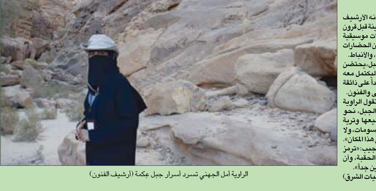
الرؤية أمل الجهني تسرد أسرار جبل عكمة (أرشيف الفنون)

إعلان نُشر على صفحة وكالة الأنباء الصومالية الحكومية على «فيسبوك»، إن الخطوات التي اتخذها «الرئيس السابق» محاولة انقلاب على الحكومة وانتهاك للدستور. وجاء تعليق وزير روبيي غداة خلاف علني بينه وبين الرئيس حول تنظيم انتخابات طال انتظارها في البلاد. وأمس، أصدر مكتب الرئيس بياناً برر فيه تعليق سلطات رئيس الوزراء بـ«ضلوعه في الفساد»، متهماً إيها بالتدخل في تحقيق حول قضية تتعلق بمصادرة أراض. وكان روبيي اتهم الأحد، الرئيس بتحقيق العملية الانتخابية، بعدما أعلن «فارماجو» سحب تكليف رئيس الحكومة تنظيم الانتخابات التي