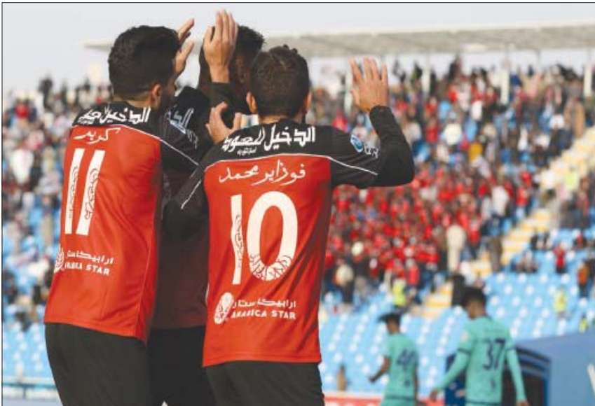
لاعب الرائد يحتفلون أمس بهدفهم الوحيد في شباك الأهلي