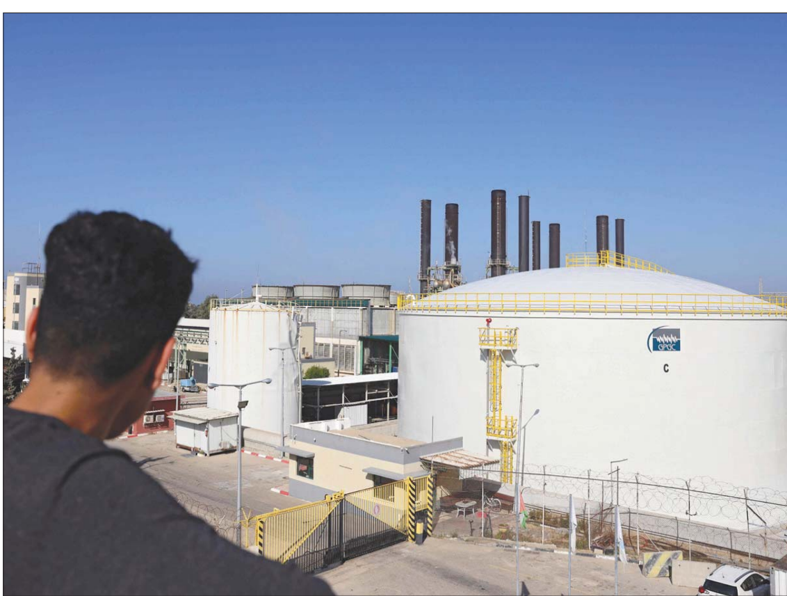
المحطة الوحيدة لتوليد الكهرباء، في غزة بالصنوبرات وسط القطاع

والتقى كل من وزيرى خارجية ورئيسي جهازي مخابرات مصر والأردن ووزير الشؤون المدنية ورئيس جهاز المخابرات لدولة فلسطين، في القاهرة، أمس، بهدف «تنسيق المواقف والرؤى بشأن كيفية متابعة نتائج القمة الثلاثية التي عُقدت في القاهرة مطلع سبتمبر (أيلول) الماضي، وبحث المستجدات التي شهدتها القضية الفلسطينية في الفترة الأخيرة». وأفسد بياناً للخارجية