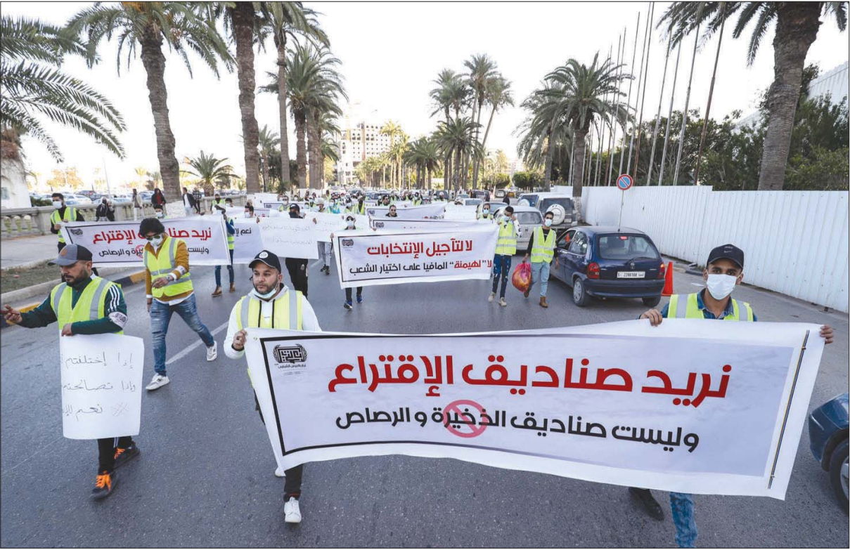
جانب من مظاهرات نظهما لبييون وسط العاصمة طرابلس رفضاً لتأجيل الانتخابات