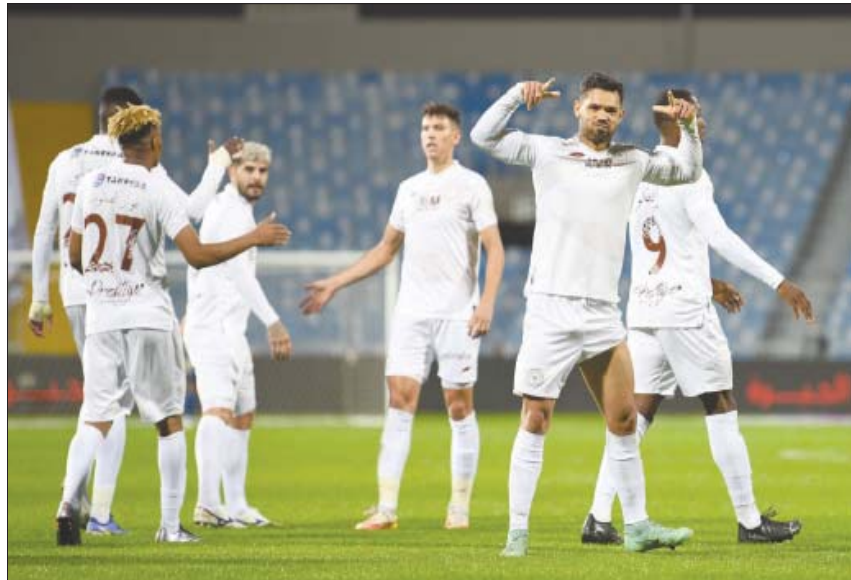
فرحة شبابية بالفوز المثير على التعاون أمس