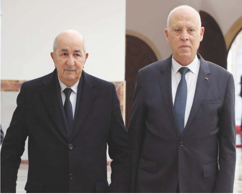
الرئيسان التونسي والجزائري في مطار تونس يوم 15 ديسمبر الجاري