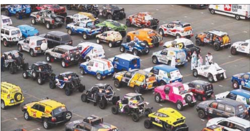
سيارات المتسابقين في طور الجاهزية للمشاركة في رالي داكار

خلالها 5 مراحل دائرية وواحدة ماراثونية. وسيستهل السائقون رحلتهم المشاقفة في الأول من يناير من مدينة جدة عبر مرحلة استعراضية قصيرة بمسافة 19 كلم قبل الوصول إلى حائل موقع انطلاق المنافسات الرسمية يوم 2 يناير، لتحدي خبايا صحراء المملكة وكتباتها الرملية وصولاً إلى خط النهاية في جدة يوم 14 يناير.