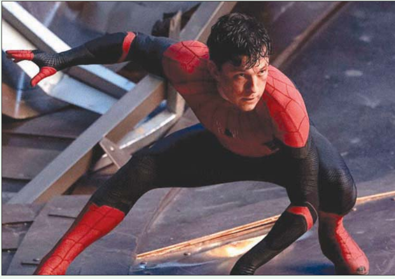
«سبايدر مان» يكشف عن وجهه