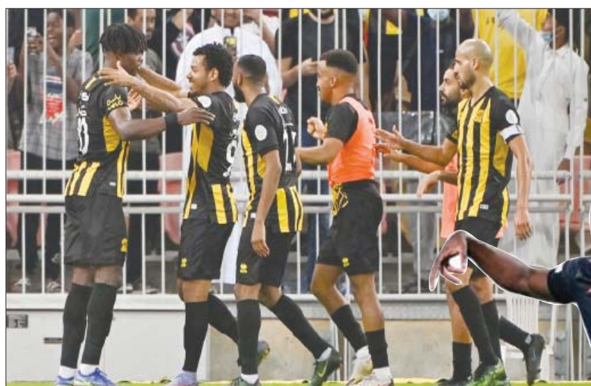
لاعبو الاتحاد يعيشون فرحة مع جماهيرهم بعد الفوز على الاتفاق

وبيّن أن المنافسين على البقاء نفس الفرق التي تضع ذلك هدفاً موسمياً، إلا أن الجولات الأخيرة قد تشهد مفاجات، كما حصل الموسم الماضي، حيث كان القاسية منافساً