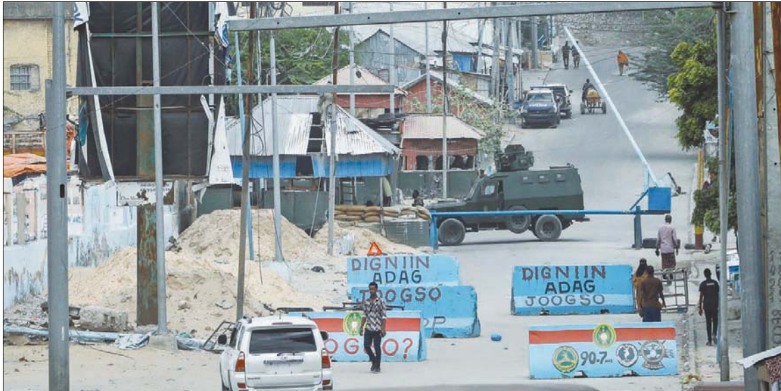
مدرعة متمركرة في شارع بمقديشو لحماية القصر الرئاسي

الفساد»، متهمًا روبري بالتدخل في تحقيق حول قضية تتعلق بمصادرة أراض. وغالباً ما تدور خلافات بين الرئيس المعروف باسم فارماجو ورئيس وزرائه. واتهم روبري الأحد، الرئيس بتقويض العملية الانتخابية، بعدما أعلن فارماجو سحب تكليف رئيس الحكومة بتنظيم الانتخابات التي أثار إرجاؤها أزمة مؤسسية خطيرة. ورد روبري باتهام رئيس الجمهورية بالسعي «إلى الاستيلاء على سلطة رئيس الوزراء بالقوة بما يخالف الدستور وقانون البلاد». وجاء في بيان صادر عن مكتب روبري، أن «رئيس الوزراء (...) مصمم على عدم تراجع عن أداء واجباته تجاه الأمة من أجل قيادة البلاد إلى انتخابات تمهيداً لانطلاق سلمي للسلطة». وأشار إلى أن رئيس البلاد لا يريد تنظيم