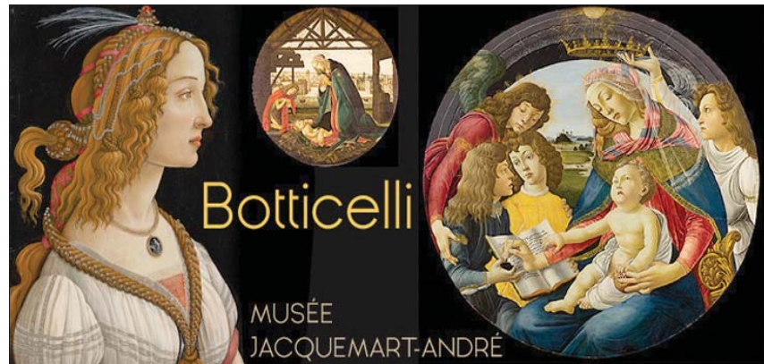
ملصق معرض بوتيتشيلي في باريس

هناك لقب يُخفي خلفه لقباً. والبوتيتشيلي الذي نحن بصدده ليس أندريا مغني الأوبرا الإيطالي الشهير الذي ما زال يسعد جمهوره بصوته له ملمس القطيفة، بل مواطنه ساندرلو بوتيتشيلي، الرسام المولود في فلورنسا والمتوفى فيها أوائل القرن السادس عشر. وماها في باريس تنفض عنه الغبار وتسخبه إلى أنوارها من خلال معرض جميل يقام في متحف «جاكمار أندريه»، ويستمر حتى نهاية الشهر المقبل.