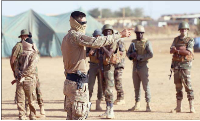
تدريب فرنسي - مالي مشترك في قاعدة مينكا الأسبوع الماضي

الاتحاد الأوروبي فرضوا على «فاغنر»، بحجة القيام بأعمال تضر بالاستقرار في كثير من الدول الأفريقية «فيما يزيد على 20 بلداً، منها جمهورية أفريقيا الوسطى وليبيا ومالي...»، وفي أوكرانيا، وعلى 3 شركات و8 أشخاص مرتطبين بها، عقوبات مالية، ومنع المسؤولين عنها من الدخول إلى أراضي الاتحاد الأوروبي.