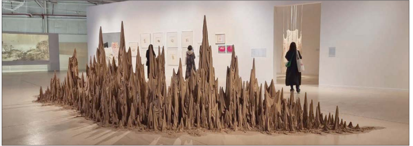
العمل الفني التركيبي «ولادة مكان» يُدهش زوار بينالي الدرعية