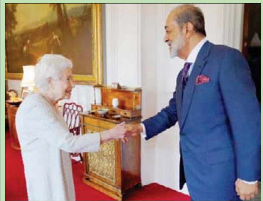
سلطان عُمان يزور بريطانيا

من جانبه، عبر فهد آل سعيد نائب رئيس الوزراء لشؤون مجلس الوزراء بسلطنة عُمان عن شكره وتقديره لخادم الحرمين الشريفين وولي العهد السعودي