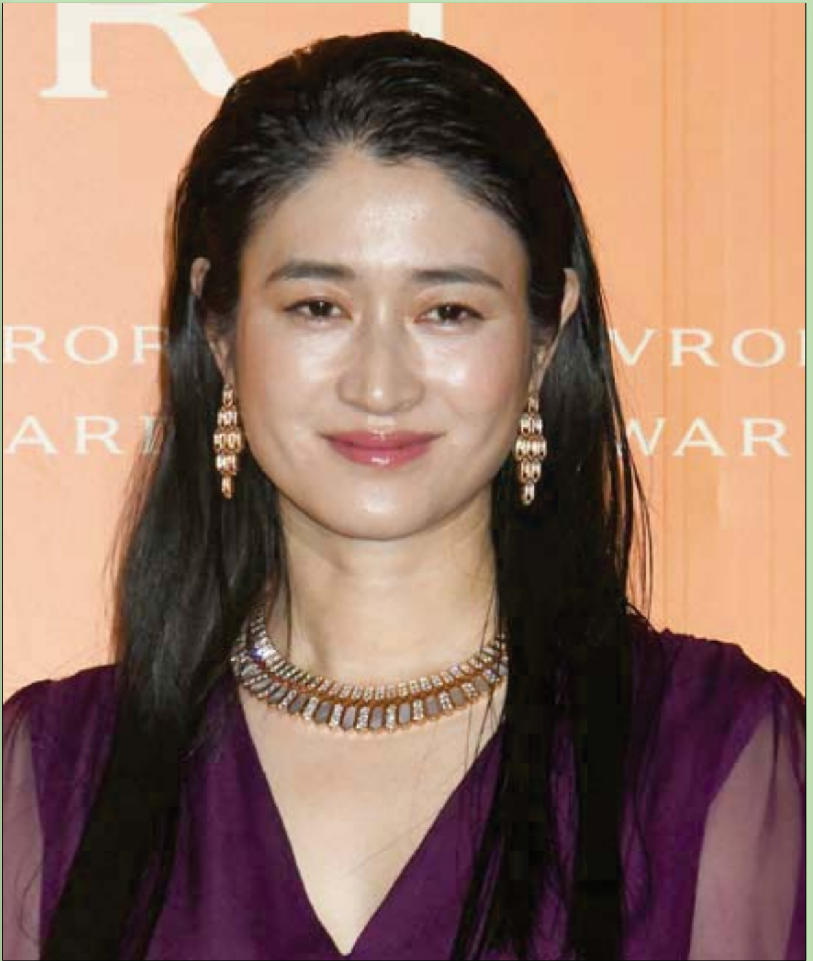
المثلة اليابانية كويوكي لدى وصولها لحضور «جوائز بولغاري أفرورا» لعام 2021 في أوراسيو اليابان