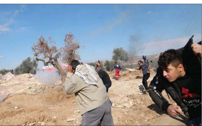
فلسطينيين يحتمون من الغاز المسيل للدموع خلال مواجهات بسبب نقطة استيطان في قرية بيتا الشهر الماضي

ضعف أو 3 أضعاف ما يربصده الجيش، ولا تقتصر على منطقة الخليل وتمت بشكل خاص حيثما تقوم بؤر استيطانية عشوائية. وحسب منظمة «بتسيلم» الحقوقية، التي تجمع معلومات حول اعتداءات المستوطنين على الفلسطينيين وتوزع كاميرات فيديو لها هذه الاعتداءات، فإنه تم رصد تصعيد بنسبة 28 في المائة في اعتداءات المستوطنين، حيث نفذ 247 اعتداء في العام الحالي مقابل 192 في العام الماضي. وحسب بيان منظمة «يش دين» (يوجد قضاء)، وهي أيضاً حقوقية، تم توثيق 540 اعتداء للمستوطنين ضد فلسطينيين، في السنوات الثلاث الأخيرة، لكن الفلسطينيين قدموا 238 شكوى حيالها فقط إلى الشرطة الإسرائيلية بمساعدة «يش دين». وجرى تقديم 12 لائحة اتهام فقط ضد مستوطنين في هذه الشكاوى، بينما بقي مئات من المعتدين الآخرين طلقاء بلا حسيب على أفعالهم.