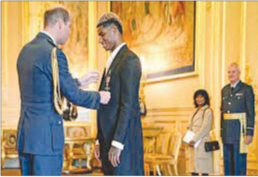
الأمير ويليام يقام راشفورد و«فارس» تقديرًا لأعماله الخيرية (أب)

● كيف تقضي فترة أعياد الميلاد، وما هي ذكرياتك عنها عندما كنت طفلًا؟ - من لعب كرة القدم لا يحتفل بأعياد الميلاد بالشكل التقليدي، لأننا عادة ما نندرب أو نكون مقيمين في فندق في ذلك اليوم نظرًا لوجود العديد من المباريات، لذلك فإننا نلتقي بأفراد العائلة لبضع ساعات ثم نعود إلى العمل مباشرة. إنه ليس شيئًا أشعر أنني أفقده، لأنني لم أكن احتفل حقًا بأعياد الميلاد بالشكل التقليدي عندما كنت صغيرًا. لم تكن لدينا هدايا حقًا، لكن المهم هو أننا كنا معًا. كانت أمي تقف في طوابير أمام بنك الطعام لتناول عشاء عيد الميلاد، وكنا نصنع أفضل ما لدينا حقًا، ويعود الفضل لها في ذلك. لم نرغب أبدًا في أن تشعر أمي بالضغط خلال الاحتفالات بعيد الميلاد، لذلك كنا نستمتع من النوم لأذهب إلى التدريبات واتناول الإفطار وأندرب، وهذه هي حياتي بشكل واضح. وفي يوم العطلة، استيقظت وأتناول الإفطار، وأقوم ببعض التمرينات من أجل الانتعاش والتعافي، ثم ربما أتمشى مع كلابي.