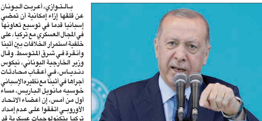
إردوغان يخاطب أنصاره في إسطنبول الشهر الماضي (رويترز)