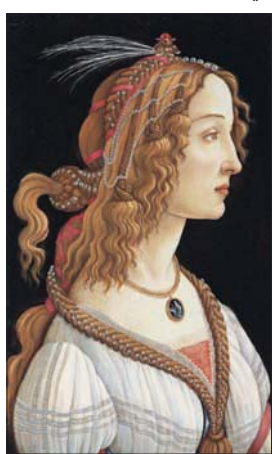
من لوحات المعرض

سنوات من تلك الأعمال استقل الفنان عن معلمه وبدأ يرسم منفرداً، ثم سرعان ما تبلور أسلوبه الخاص المختلف عن أساليب مجاليه من رسامي فلورنسا. راح يخلق في أجواء من الأناقة الفكرية التي تنعكس في خطوطه والوانه، فقد كانت ريشته «مثققة» وذات إحياءات نفسية ووجودية عميقة. تحرر الرسام من الصورة الأيقونية التقليدية للعدراء، وراح يرسم حوريات في أجواء تفيض بالشفافية، أو مجاميع محشدة في سوق أو مناسبة دينية، مع الفارق في التعبير عن الرقة والشفافية من