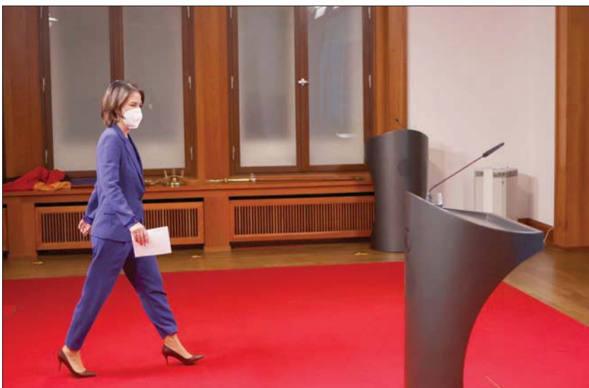
وزيرة الخارجية الألمانية تستعد لعقد مؤتمر صحفي في برلين أمس