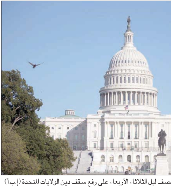
وافق الكونغرس الأميركي بعيد منتصف ليل الثلاثاء الأربعاء على رفع سقف دين الولايات المتحدة

إجراء شكلياً. لكن الإجراء كان محور مفاوضات شاقة جداً في الكونغرس، حيث عدّ الرئيس شيكا على بياض بينما يتهمونه بالمساهمة في التضخم المتسارع. وأدانت النائبة الجمهورية إليز ستيفانوك «النفقات الكبيرة للديمقراطيين» التي «أدت أساساً إلى تضخم تاريخي بشكل مبرر» بذلك رفضها الإجراء... ورد على ذلك، شهدت موانئ المملكة خلال نوفمبر (تشرين الثاني) لعام 2021 ارتفاعاً في حاويات المسافنة بنسبة 20,23 في المائة