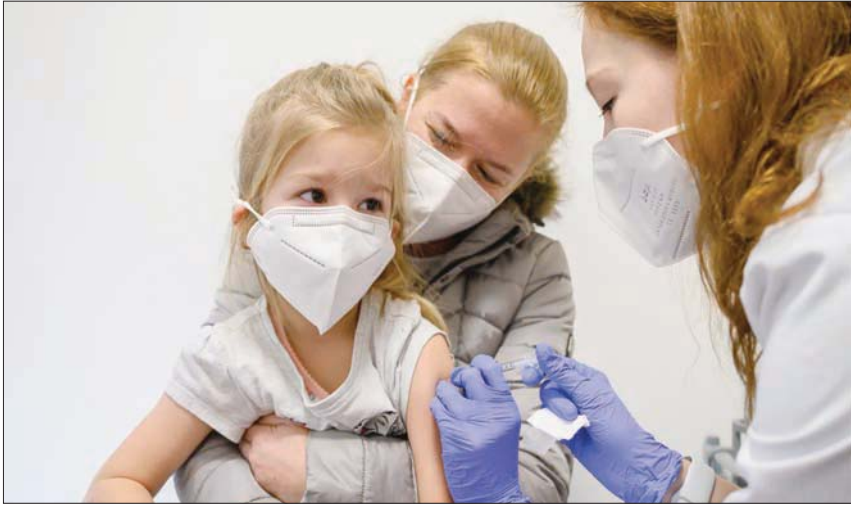
طفلة تتلقى جرعة من لقاح ضد «كوفيد - 19» في مستشفى بنغازيا أمس