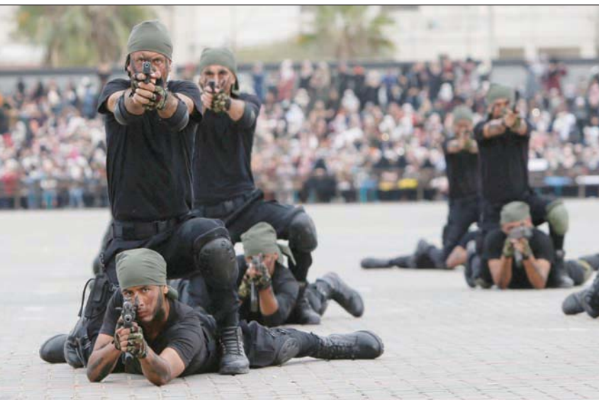
عناصر تابعة لحماس، خلال حفل تخرج في مدينة غزة الأحد الماضي