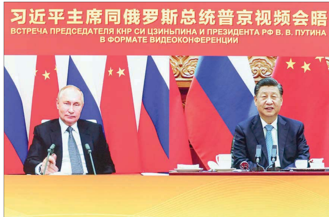
صورة وزعتها وكالة شينخوا لمشاركة شي وبوتين في قمة افتراضية أمس (أب)

علم محاييد، وبالتالي سيتمكنون من المشاركة في بكين، فيما يُمنع المسؤولون الروس، وبينهم بوتين، من حضور المسابقات الدولية إلا بدعوة من رئيس الدولة المضيفة. وتعمل روسيا والصين على تعزيز تحالفهما في مواجهة تدهور العلاقات مع الغرب. كما قام العضوان الدائم في مجلس الأمن التابع للأمم المتحدة، من جانبيها، بتعزيز علاقاتهما في مجالات الاقتصاد والدفاع والطاقة. في المقابل، وخذت دول غربية مواقفها تجاه روسيا بسبب مناوراتها العسكرية على الحدود الأوكرانية، ما يثير مخاوف البعض من غزو أوكرانيا. فيما تقول موسكو إنها تشعر بالتهديد من تزايد الوجود العسكري لحلف شمال الأطلسي في أوروبا الشرقية، ولا سيما من دعمه لأوكرانيا. من واشنطن وحلفائها بانتظام حول تايوان وسوء معاملة الأقلية المسلمة الأويغور وتقييد الحريات السياسية في إقليم هونغ كونغ.