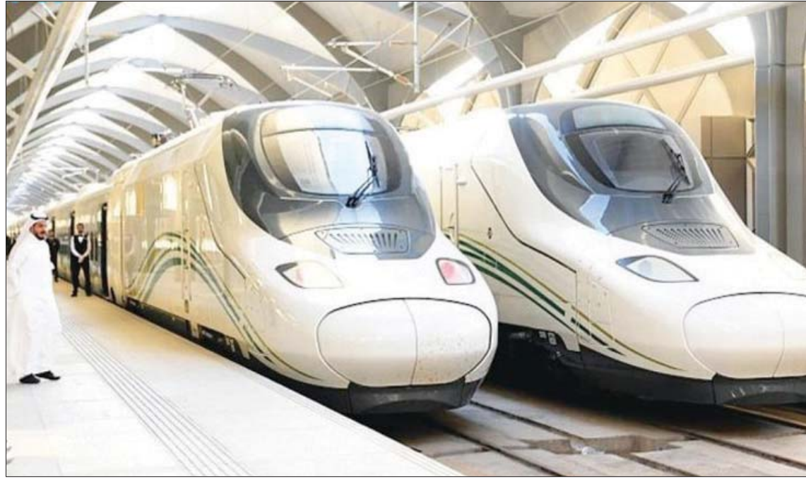
دول مجلس التعاون توافق على تأسيس هيئة لمشروع السكك الحديدية (الشرق الأوسط)

الرياض، بندر مسلم فيما وافق المجلس الأعلى لمجلس التعاون لدول الخليج العربية على إنشاء الهيئة الخليجية للسكك الحديدية، مؤخراً، أكد مختصون لـ «الشرق الأوسط» أهمية المشروع في تسريع ربط الدول الأعضاء لتسهل في نمو الخدمات اللوجيستية وخلق تنافس في أسعار السفر والتنقل بجانب تنمية حركة الإنتاج والسلع. وأعلنت الفرق الفنية والتشريعية والقانونية مشروع ربط السكك الحديدية بين دول مجلس التعاون الخليجي العام الماضي عن إنجاز عدد من الدراسات والخطوات الخاصة بالمشروع، موضحة أن العام الحالي سيشهد إنشاء الهيئة الخليجية للسكك الحديدية بعد اعتماد دراستها من قبل اللجنة الوزارية للنقل والمواصلات في دول المجلس. وذكرت الهيئة العامة للنقل السعودية، أمس، أن موافقة المجلس الأعلى على إنشاء الهيئة الخليجية للسكك الحديدية خلال القمة ستعزز من تكامل الجهود المشتركة لمستقبل جديد وواعد لقطاع النقل بالخطوط الحديدية الخليجية. وقال الخبير الاقتصادي أحمد الجبير لـ «الشرق الأوسط»، إن الهيئة الخليجية للسكك الحديدية ستعكس بفوائد عدة للشركات والمصنعين والموارد ورؤوس الأموال البشرية، وكذلك الربط بين القارات وتقوية اللحمة بين أبناء الخليج، إضافة إلى فتح مجال إنشاء مشاريع تزيد من تنافسية أسعار التنقل بين دول المنطقة. وإبان الجبير أن موافقة المجلس الأعلى لمجلس التعاون لدول الخليج العربية على إنشاء الهيئة خلال القمة المنعقدة في الرياض ستعزز من تكامل الجهود المشتركة لمستقبل جديد وواعد لقطاع النقل بالخطوط الحديدية الخليجية، بالإضافة إلى أهمية تشغيله وربطه بجميع دول الأعضاء مع سكة حديدية إقليمية ودولية. وأوضح مستشار اللوجيستيات نشمي الحربي