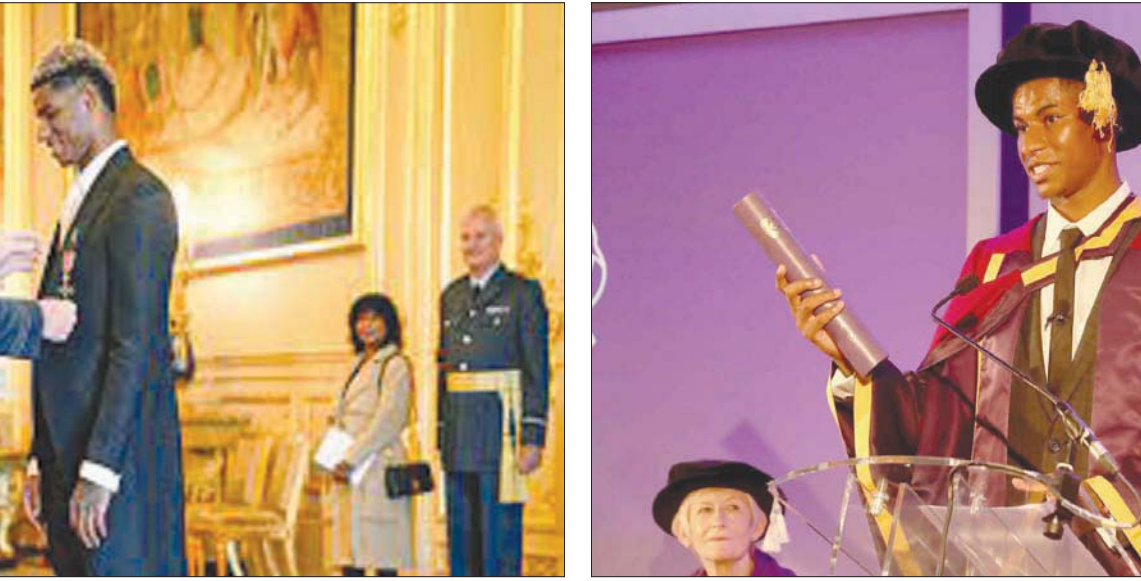
جامعة مانشستر تمنح راشفورد شهادة تقديرية لدوره في تثقيف الأطفال المحرومين

وهذا هو الحال بالنسبة لي أيضًا. أحب القيام ببعض الأشياء الروتينية التي لم تتغير منذ أن كنت صغيرًا، فأننا استيقظ من النوم لأذهب إلى التدريبات واتناول الإفطار وأندرب، وهذه هي حياتي بشكل واضح. وفي يوم العطلة، استيقظت وأتناول الإفطار، وأقوم ببعض التمرينات من أجل الانتعاش والتعافي، ثم ربما أتمشى مع كلابي. ● ذكرت وجبة الإفطار عدة مرات في كتابك، فما هي وجبة الإفطار المفضلة لديك؟ - لا يختلف الأمر حقًا عما كانت عليه وجبة الإفطار عندما كنت طفلًا، لكي أكون صادقًا، فأننا تناولنا حبوب قمح وبنابيس، ورقائق الذرة، وحبوب كوكو بوبس. أو إذا كنت أشعر بالرغبة في القيام بشيء مختلف، فإنني تناولنا بيضا مقليا وخبزًا محمصًا، وهي الأشياء التي أتناولها أيضًا في ملعب التدريب. وأكد مرة أخرى على أنني أحب القيام بمثل هذه الأشياء الروتينية. ● ما هي أفضل الكتب في هذا العالم من وجهة نظرك؟ - يمكنني أن أقول إنها الكتب التي تعرض في نادي الكتاب الخاص بي، لكن بالإضافة إلى ذلك أحب كتاب «الصبوي ذو الأجنحة» للييني هنري، فهي قصة مغامرات ممتعة للأطفال عن الإسطبل الخارقين تمثل جميع الأطفال. كما أن الرسومات في هذه القصص من إبداع كينون فيريل، وهو أيضًا شخص رائع. ● ماذا تقرأ في هذه اللحظة؟ - كارل أنكا، الذي كتب معي كتاب «أنت بطل»، أهداني كتاب