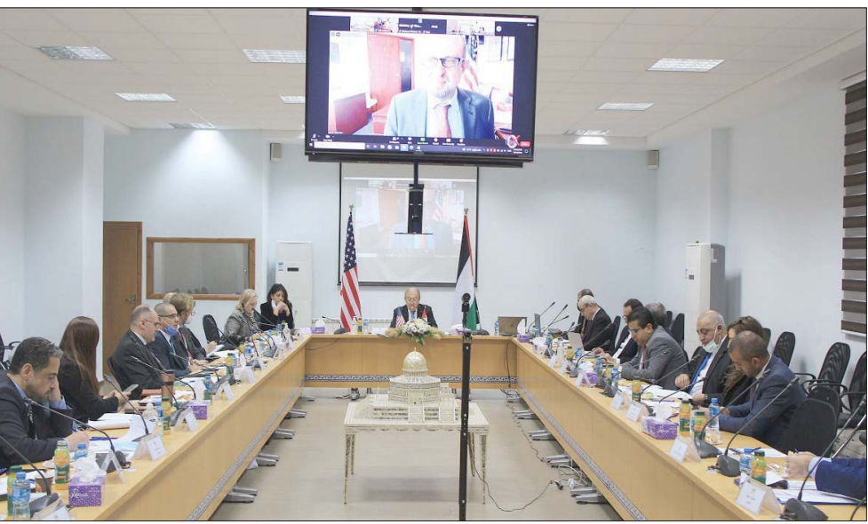
اجتماع الحوار الفلسطيني - الأمريكي عبر الفيديو الثلاثاء الماضي