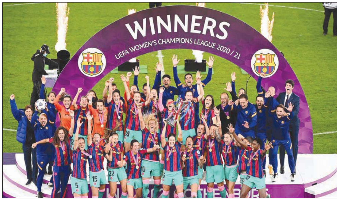
لاعبات برشلونة يحتفلن بكأس دوري أبطال أوروبا للسيدات

في طوكيو، وهو ما يعكس في تصنيفات هذا العام. ويهيمن نادي برشلونة على قائمة الأفضل بوجود 13 لاعبة بين الـ 100 الأولى، وحصلت أليكسيا بوتيلاس، الفائزة بالكرة الذهبية لأفضل لاعبة في العالم، على 3136 نقطة، بفارق 293 نقطة عن فيفيان ميدوما، التي احتلت المركز الثاني للعام الثاني على التوالي، متقدمة على الفائزة السابقة بالجائزة سام كير. واختار ستة وأربعون من أصل 83 من المصوتين بوتيلاس في المركز الأول، في حين أعطى 15 شخصًا أصواتهم لميدوما كأفضل لاعبة. وهيمنت اللاعبتان المتاهلتان إلى نهائي دوري أبطال أوروبا على المراكز العشرة الأولى، التي ضمت ست لاعبات من برشلونة وثلاث لاعبات من تشيلسي، بالإضافة إلى ميدوما من أرسنال. وكان التغيير الأبرز في قائمة أفضل عشرة لاعبات هذا العام يتمثل في وجود خمس لاعبات في النصف العلوي من القائمة لأول مرة: بوتيلاس، وجيني هيرموسو، وفران كيربي، وإيرين بارديس، وإيتانا يونماتي.