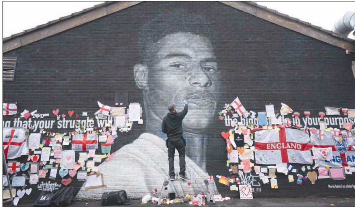
جدارية راشفورد في مدينة مانشستر أصبحت عنوانًا لمكافحة العنصرية

حالي المزاجية بنتائج المباريات التي لعبها، لكنني أحاول دائمًا كان نوعًا مختلفًا من الكتب التي تركز على طريقة التفكير، وكان هذا هو بالضبط ما كنت أحتاج إليه عندما انضمت للفريق الأول لمانشستر يونايتد. ما زلت أقرأ هذا الكتاب كل بضعة أشهر، لأرى مدى التقدم الذي أحرزته. ● في الكتاب وفي الحياة يبدو أنك شخص يواجه كل يوم بقدر كبير من الإيجابية. فما هي الأشياء الروتينية التي تقوم بها كل صباح، وما الأشياء التي تغعلها لإعداد نفسك على أفضل وجه لبقيّة اليوم؟ - سيكون من الخطأ القول إنني إيجابي دائمًا، لا سيما بالنظر إلى كيف يمكن أن تتأثر