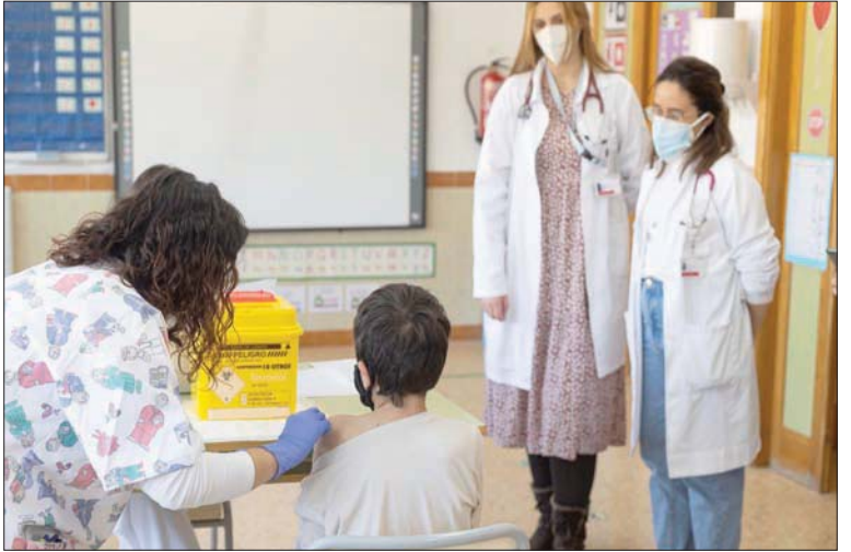
طفل يتلقى اللقاح في مدرسة بإسبانيا أمس

مديره، «الشرق الأوسط» بدأ تلقيح الأطفال أمس (الأربعاء)، في دول عدة في أوروبا حيث قد تصبح السلالة متحورة «أوميكرون» أكثر سلالات «كورونا» انتشاراً بحلول منتصف يناير (كانون الثاني) المقبل. فبعد الدنمارك والنمسا، بدأت إسبانيا واليونان والمجر إضافة إلى مدن ألمانية عدة بينها برلين، تلقيح الأطفال دون 12 عاماً، وهي فئة عمرية من بين أكثر الفئات المعرضة حالياً للإصابة، حسبما جاء في تقرير