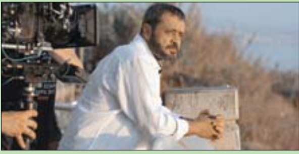
جورج وسوف... «هذا أنا بأخطائي وغيوبي»

له خصم. فوضع في دربه الأخير، منهم للمحن نور الملاح. ولتهوره، لم يخفق قلبه لأثنين من رواعته: «حلف القمر» و«روحي يا نسمة».