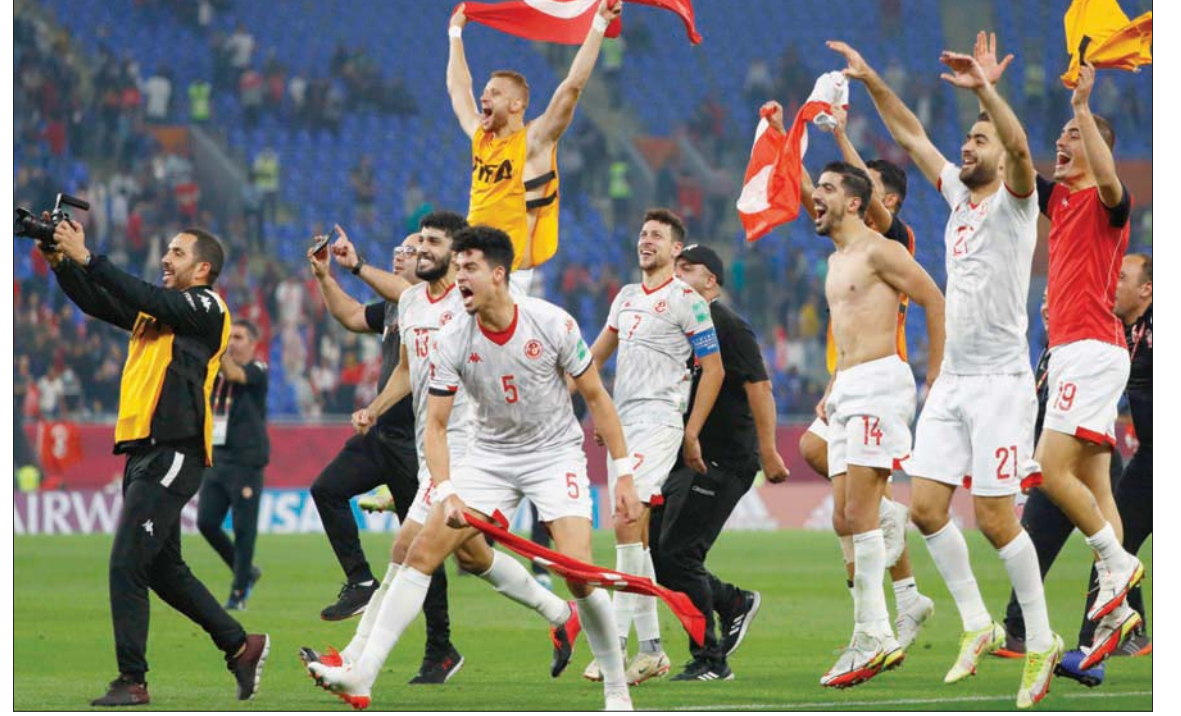
لاعب المنتخب التونسي محتفلين بعد فوزهم على المنتخب المصري 0-1

راسية خطيرة إثر ركنية مرت قوية فوق العارضة، رد عليها برعونة قائد مصر عمرو السولية فوق العارضة (90+1). وفيما كانت المباراة تتجه للتعميد بشكل وثيق، حصلت تونس على ركلة حرة إلى يمين منطقة الشناوي، لعبها الجديبل نجيم السليتي، حاول السولية تشتيتها، لكنها حلت فوق الشناوي، وهبطت في المرمى (5+90). وانفجرت فرحة لاعبي تونس الذين اجتاحتوا الملعب بعد الهدف وسط فرحة جماهيرية هستيرية وصدمة مصرية.