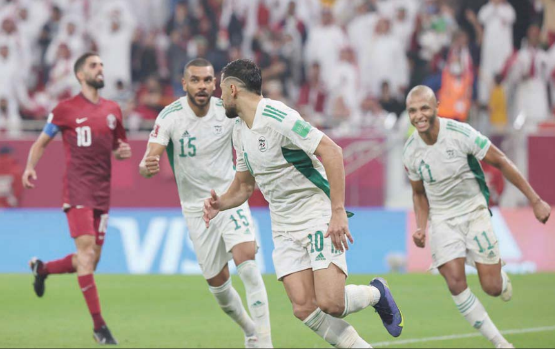
فرحة جزائرية بعد تسجيل هدف في مرمى قطر