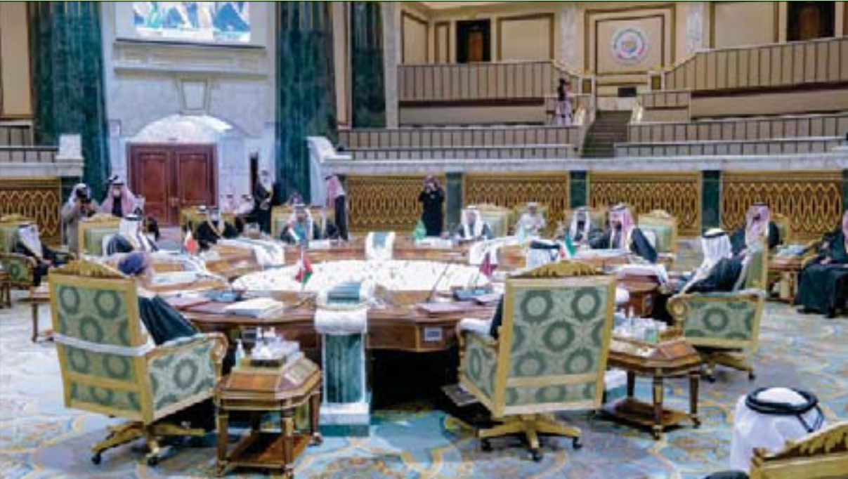
جانب من اجتماع القمة الخليجية الذي عقد في الرياض الثلاثاء

الذي يتطلب مزيداً من التكاتف والتلاحم وتنسيق الرؤى والمواقف تجاه القضايا الحورية محل الاهتمام المشترك، وتوحيد التصدي للتحديات والتهديدات الخارجية، وفي مقدمتها التدخلات الإقليمية المفروضة في الشؤون الداخلية للدول العربية، مشيراً إلى أن مخرجات هذه القمة تصب في صالح تحقيق تطورات شوب منطقة الخليج وتوثيق من جهته، أشاد عادل العسومي رئيس البرلمان العربي بمخرجات القمة الخليجية الأخيرة، مثنياً للجهود المخلصة التي بذلتها السعودية بقيادة خادم الحرمين الشريفين وولي عهده من أجل إنجاح هذه القمة. وأكد في بيان أن القمة الخليجية التي احتضنتها المملكة جاءت في ظل تحديات وظروف استثنائية تمر بها المنطقة، الأمر