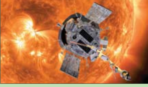
مسبار باركر الشمسي وهو يقترب من الشمس