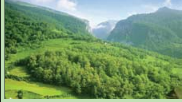
جبال البيرينية على الحدود بين إسبانيا وفرنسا

فوا (فرنسا)، «الشرق الأوسط» مثل حطاب إسباني أول من أمس (الثلاثاء)، أمام محكمة فرنسية بتهمته قطع مئات الأشجار بطريقة غير شرعية في إحدى قرى جبال البيرينية، ويواجه السجن 24 شهراً، منها 12 شهراً مع وقف التنفيذ في حال إدانته، بالإضافة إلى غرامة قدرها 25 ألف يورو. وفق وكالة الصحافة الفرنسية. وقُطعت نحو مائة من أشجار البلوط العميرة، وأكثر من 300 شجرة صنوبر بطريقة غير شرعية في نوفمبر (تشرين الثاني) 2020 وفبراير (شباط) 2021. في بلدة بيرل إيه كاستوليه التي يراوح ارتفاعها بين 600 و2000 متر عن سطح البحر في البيرينية الفرنسية، ونقلت هذه الأشجار إلى إسبانيا. وتقدّم 21 فرنسياً متضرراً بشكاوى. طالب المدعي العام بحبس رئيس الشركة 24 شهراً، منها 12 مع وقف التنفيذ، ويتوقع غرامة عليه قدرها 25 ألف يورو (200 ألف يورو ضد شركته)،