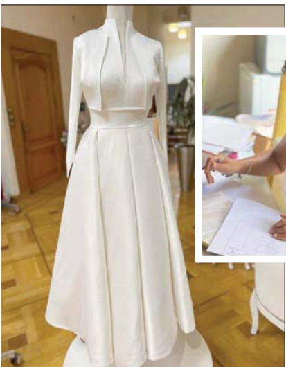
فستان زفاف جينيفر غيتس... وفي الإطار رنا يسري (الشرق الأوسط)

وتريد: «قبل كتب الكتاب بأسبوع واحد فقط، أخبرتني والدة العريس بانني سأكون مصممة فستان العروس أيضاً، وتصدت: «لا أذكر أنه كان تحدياً كبيراً، لكنني كنت سعيدة جداً». وأضافت: «كانت هذه العروس من كبار العائلات، وكان هذا العمل من أجلها، وهو أمر كبير جداً».