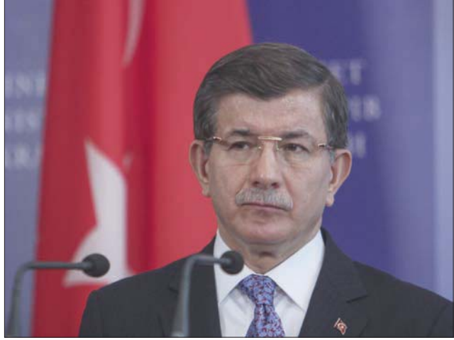
أحمد داود أوغلو

في أي حال، تعاني أحزاب المعارضة في تركيا غيابا شبيه تام لأي نافذة تطل عبرها على الجماهير، تتعرض أفكارها وبرامجها وحلولها للمشاكل التي تواجهها البلاد. أما السبب الأساسي، كما سبقت الإشارة، فهو خضوع ما يقف 95 في المائة من الصحف والقنوات التلفزيونية للسيطرة المباشرة أو غير المباشرة لحزب «العدالة والتنمية الحاكم»، ونتيجة لهذا الوضع تحاول الأحزاب والشخصيات السياسية المعارضة الوصول إلى الجماهير عبر وسائل التواصل الاجتماعي التي عوضت إلى حد بعيد غيابها عن وسائل الإعلام. ووفرت تفاعلا مباشرا ومؤثرا مع جموع المواطنين، وعلى سبيل المثال، عندما أعلن رئيس الوزراء الأسبق أحمد داود أوغلو، في ديسمبر (كانون الأول) 2019 إطلاق حزبه المعارض الجديد باسم «المستقبل»، بعد انفصاله عن حزب «العدالة والتنمية» الحاكم لخلافات مع الرئيس أردوغان، فإنه انتقد صراحة