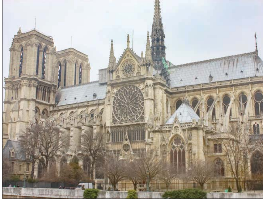
كاتدرائية نوتردام في باريس

الكاتدرائية، وفقاً لعشرات من الشخصيات الثقافية والمفكرين الذين عارضوا المقترحات. مرت «نوتردام» بالفعل بأكثر من عامين من جهود الترميم الحثرة، بعد أن شت حريق هائل في أبريل (نيسان) 2019. أدى إلى تدمير البرج ومعظم السقف. وجرى تأمين المبنى بما يكفي لبدء عملية إعادة البناء، والمتوقع أن تكتمل في الوقت المناسب لمواكبة دورة الألعاب الأولمبية في باريس عام 2024. في البداية، فكرت السلطات الفرنسية في اغتنام الفرصة لإعادة صياغة بنية الكاتدرائية بشكل ملحوظ. وأوصى خبراء التراث في نهاية المطاف بإعادة النصب إلى سابق عهده، وفي العام الماضي، تخلى الرئيس إيمانويل ماكرون عن فكرة استبدال «برج القرن التاسع عشر» بشيء أكثر حداثة. وقّع يوم الثلاثاء نحو 100 من الشخصيات العامة في فرنسا باسمائهم على رسالة مفتوحة نشرتها صحيفة «لوفيغارو» المحافظة، تحت عنوان «نوتردام دو باريس: ما تركته النيران تدمره الأبرشية».