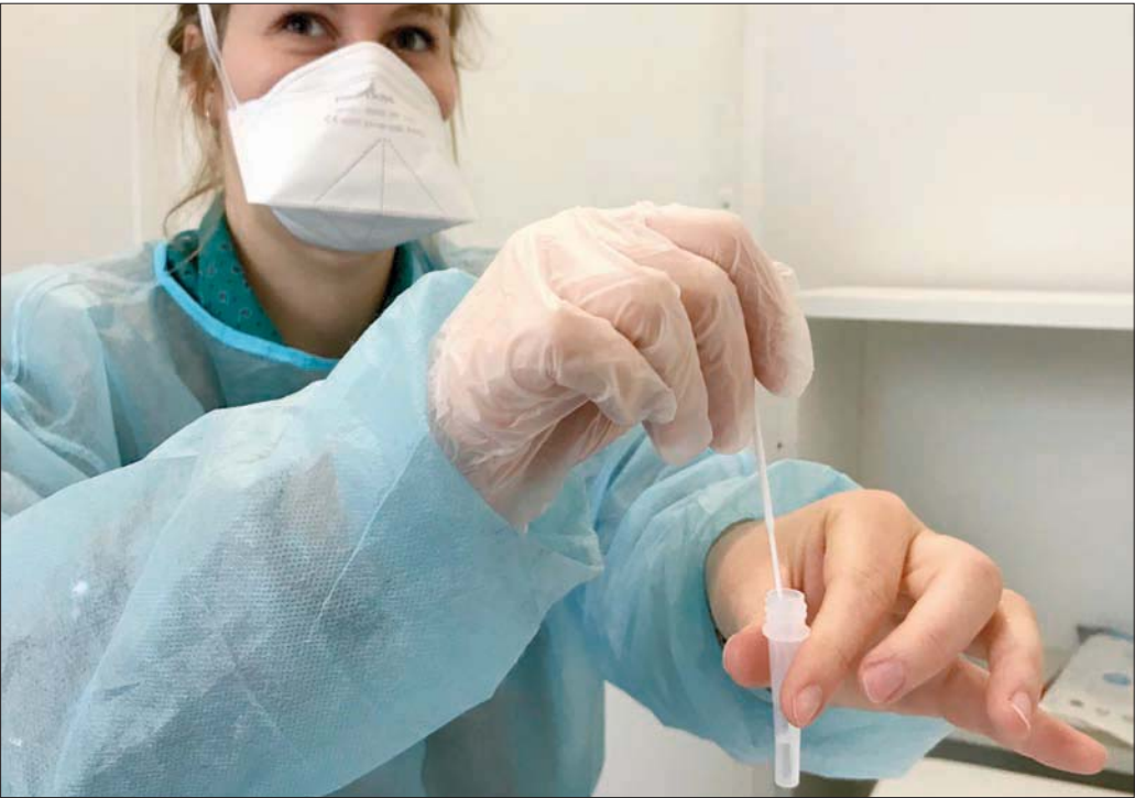
«الصحة العالمية» تطالب بتكثيف التطعيم لمواجهة المتحور الجديد

إلى جانب ذلك، شددت الوكالة الأوروبية للأدوية والمركز الأوروبي لمكافحة الأمراض السارية والوقاية منها على أهمية الإسراع في تخفيف جهود التطعيم والاسترشاد بالتوصيات العلمية لإعطاء الجرعات المعززة من اللقاحات. وكانت الهيئتان الأوروبيتان قد عبرتا في بيان مشترك عن «القلق العميق من التطورات الأخيرة في المشهد الوبائي الأوروبي الذي يسجل منذ أسابيع ارتفاعاً مطرداً في عدد الإصابات الجديدة والحالات التي تستدعي العلاج في المستشفى، خاصة في البلدان التي ما زالت معدلات تغطيتها اللقاحية متدنية».