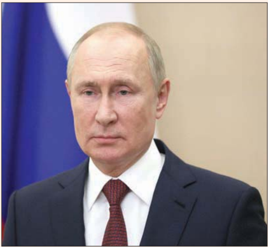
الرئيس الروسي فلاديمير بوتين