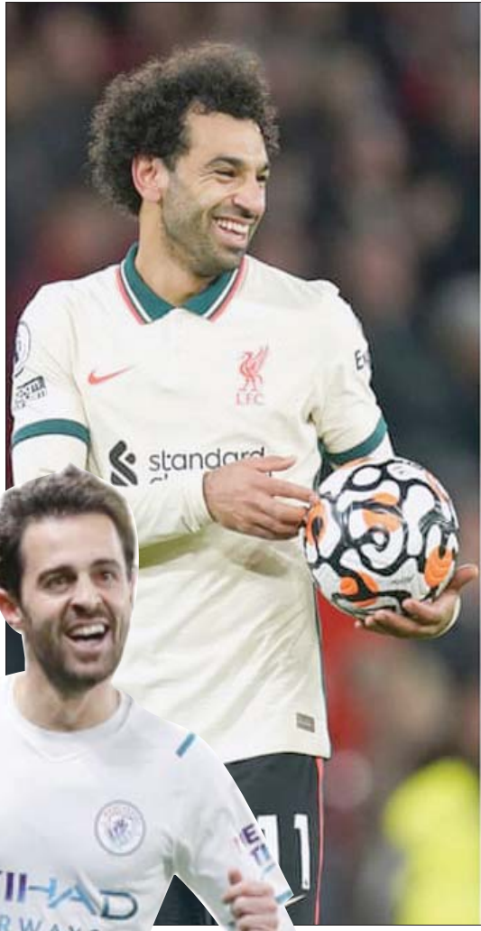
من اليمين: لوكاكو - دي بروين - صلاح