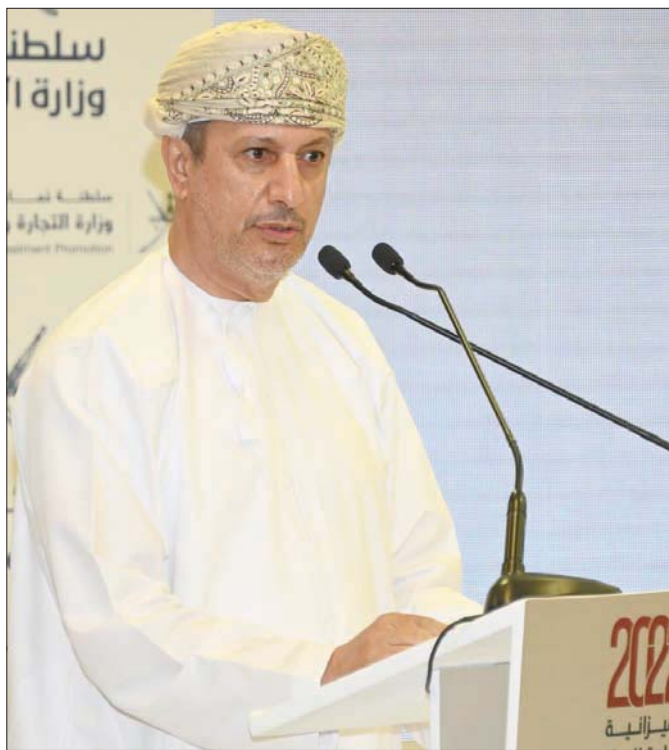
سلطان الحبيسي وزير المالية العماني

حتى نهاية عام 2021 تشير إلى ارتفاع صافي إيرادات النفط بنسبة 56 في المائة وارتفاع إيرادات الغاز بنسبة 40 في المائة، وانخفاض الإيرادات غير النفطية بنسبة 14 في المائة».