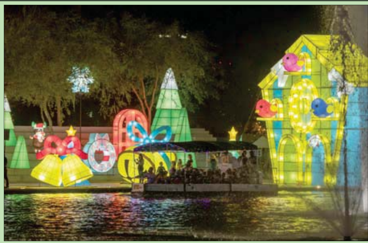
انطلاق «مهرجان أضواء لورتوبيا» في مونتييري بولاية نويفو ليون المكسيكية تحضيراً لاستقبال «الميلاد» ورأس السنة... وهو يُعد الأكبر من نوعه في البلاد ويستمر حتى 16 يناير 2022 (إ.ب.أ)

سان فرانسيسكو، «الشرق الأوسط» في المؤتمر العالمي لمطوري «أبل» في يونيو (حزيران) الماضي، كشفت شركة الإلكترونيات الأميركية العملاقة عن خططها لإضافة خاصية دعم مفاتيح غرف الفنادق والمنازل والمكاتب إلى خدمة المحفظة الرقمية «أبل» التي أعلنت «أبل» أن سلسلة فنادق «حياة»، ستكون أول شريك فندقي يتعاون معها في دعم التكنولوجيا الجديدة، في دعم التكنولوجيا الجديدة، حسيماً ذكرت وكالة الأنباء الألمانية. وستتيح سلسلة الفنادق لنزلائها استخدام خاصية دعم مفاتيح الغرف في محفظة «أبل والبيت» في ستة من فنادقها الأميركية في البداية، مع إضافة المزيد من الفنادق في المستقبل. وستعمل الخدمة الجديدة على الهواتف الذكية إلى جانب تطبيق «أورلد أوف حياة». وبعد حجز الغرفة عبر تطبيق «أبل والبيت»، ستظهر شاشة للمستخدم تعرض عليه خيار إضافة مفتاح الغرفة إلى المحفظة. وتشبه هذه التجربة عملية حجز الفنادق عبر المحفظة الرقمية، من ثم يظهر خيار الضيف على زر لإضافة بنود إلى القيادة. «أبل والبيت» لاستخدامها فيما بعد. وكما هو الحال في التذاكر الأخرى، يمكن إضافة مفتاح غرفة الفندق على الفور بعد حجز الغرفة. ومع ذلك فإن المستخدم لن يتمكن من فتح غرفة الفندق باستخدام هاتفه الذكي قبل أن يسجل الدخول إلى الفندق فعلياً. وبمجرد إضافة مفتاح الغرفة إلى محفظة «أبل والبيت»، ستظهر على الشاشة تواريخ الحجز واسم الفندق وتاريخ تسجيل الدخول المقبل.