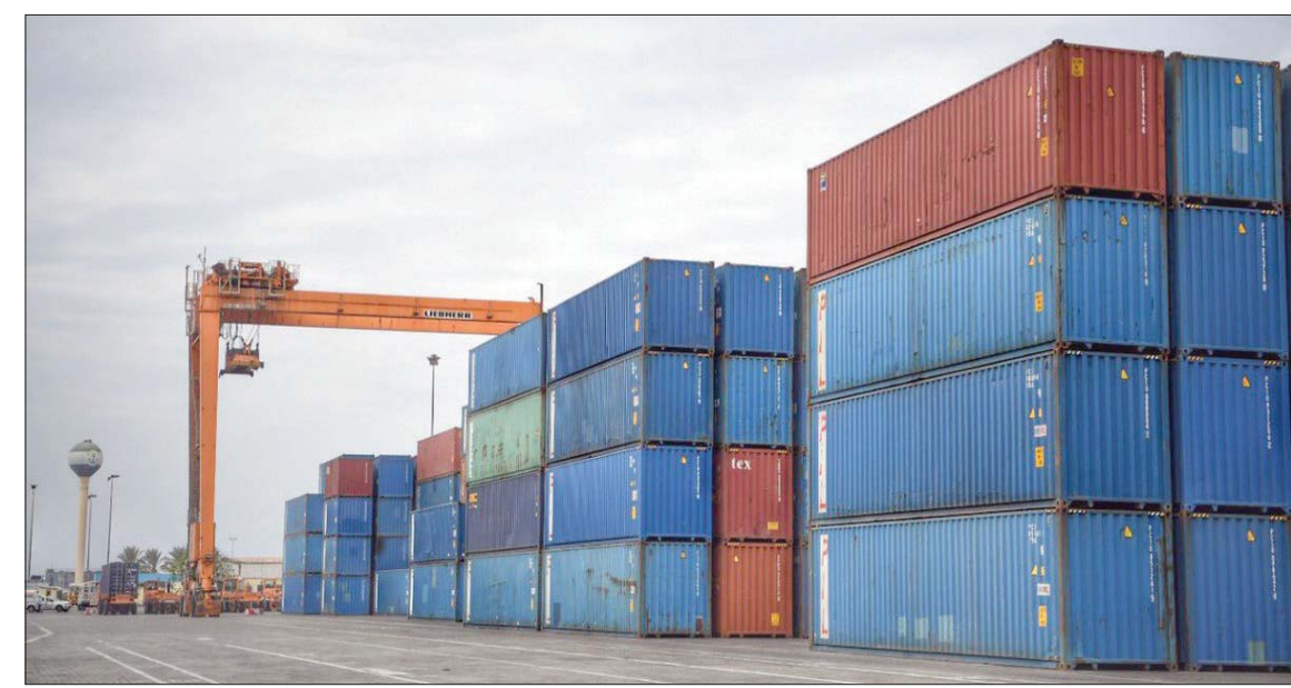
السعودية توسع الملاحية والمسافنة والحركة اللوجيستية في موانئها (الشرق الأوسط)

واستحوذت الإمارات على 66 في المائة من إجمالي الواردات السعودية بقيمة 3,13 مليار ريال، يارفع قدره 11 في المائة مقابل الفترة ذاتها من عام 2020، وبمقارنة سبتمبر بشهر أغسطس (آب)، تكون واردات السعودية الخليجية تراجعت بنسبة 23 في المائة بقيمة 1,39 مليار ريال.