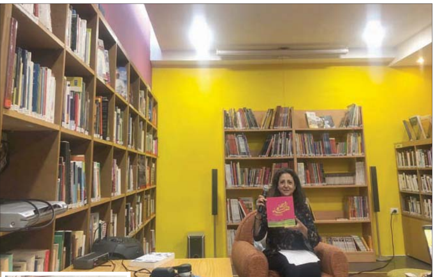
مشهد خارجي لمكتبة دار صنوبر بيروت