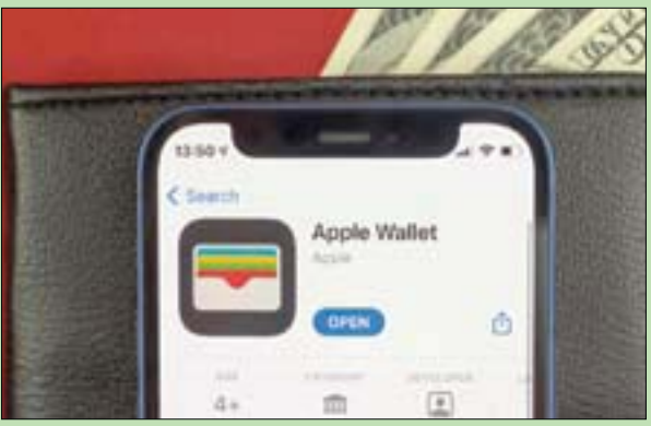
تطبيق «أبل والبيت» على شاشة «آي فون» (شاترستوك)