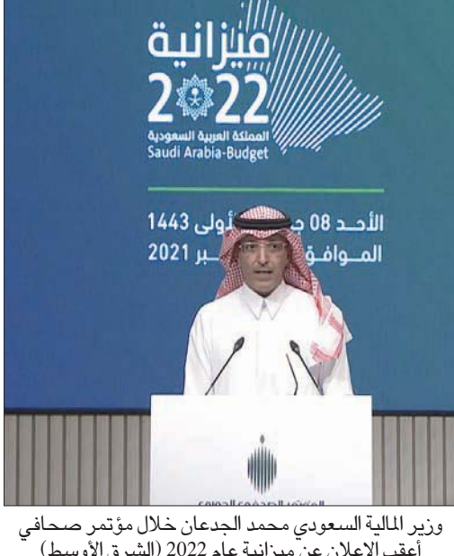
وزير المالية السعودي محمد الجدعان خلال مؤتمر صحفي أعقب الإعلان عن ميزانية عام 2022