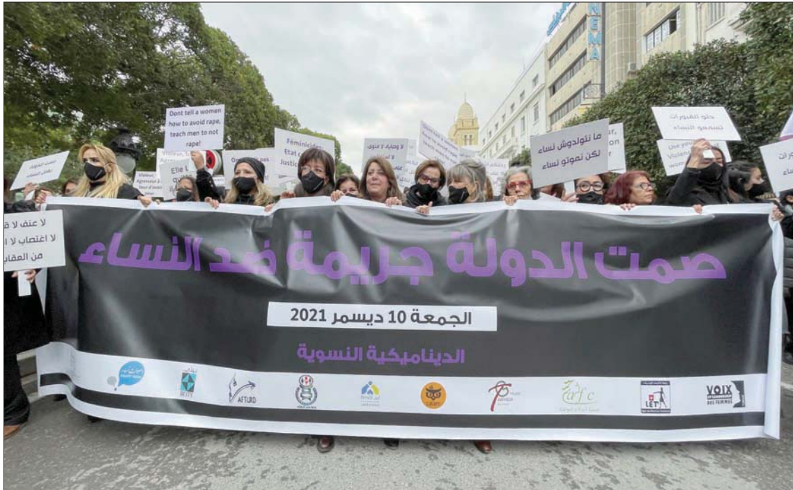
مظاهرة نسائية في تونس أمس