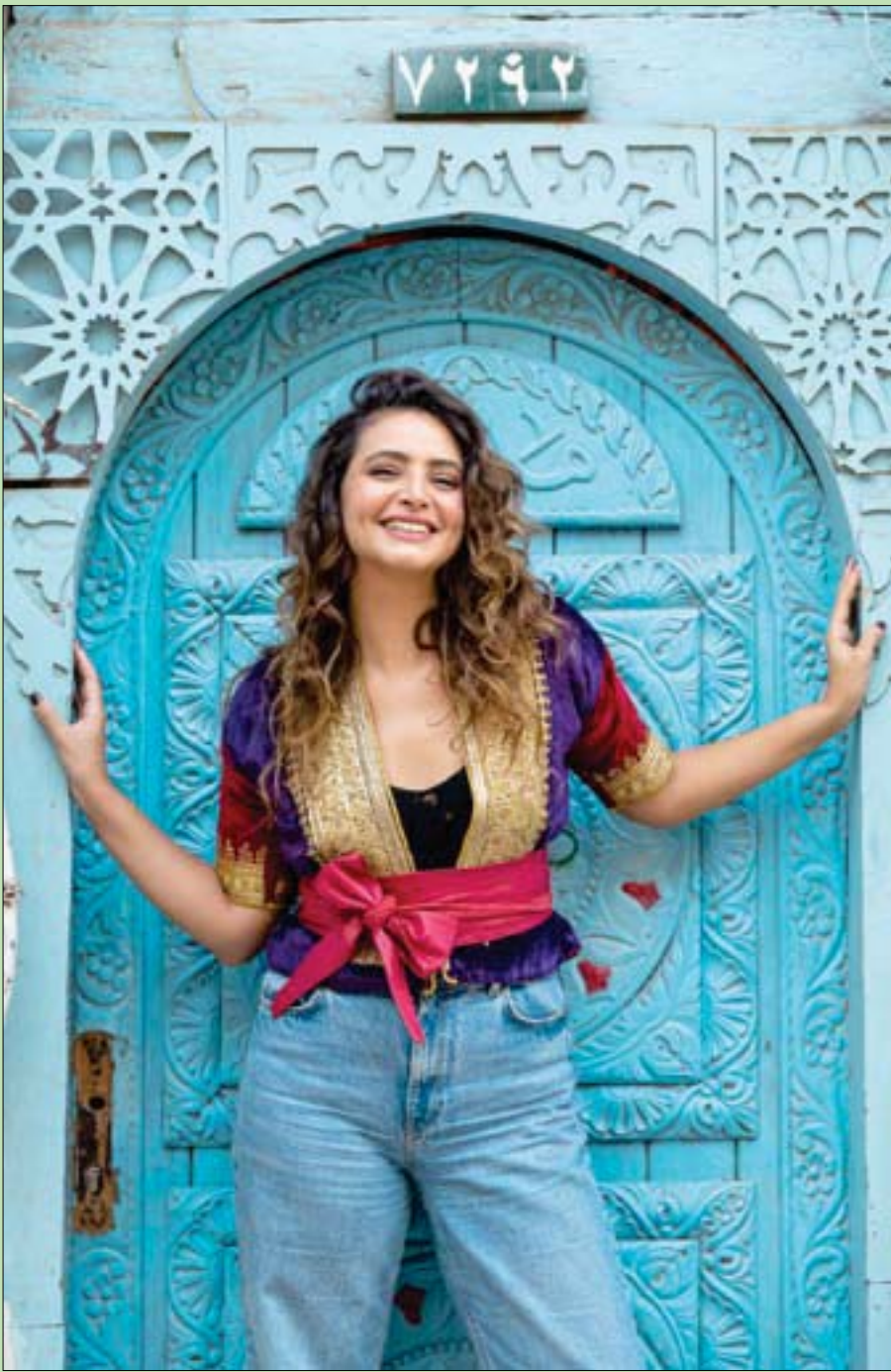
المثلة والمنتجة التونسية أميرة الدرويش في المدينة القديمة بجدة ضمن فعاليات الدورة الأولى لمهرجان البحر الأحمر السينمائي