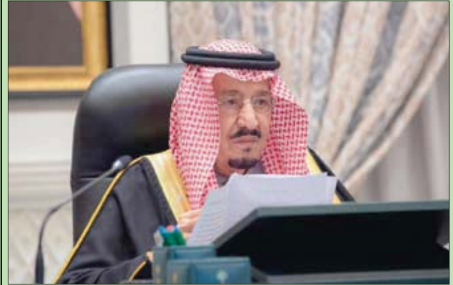
خادم الحرمين لدى ترؤسه جلسة مجلس الوزراء الاستثنائية لإعلان الميزانية أمس (واس)

الرياض، بندر مسلم أقرت السعودية، أمس، الميزانية العامة التقديرية للدولة للعام المالي 2022 التي يقدر حجم الإنفاق فيها بـ 955 مليار ريال (254 مليار دولار)، مقابل إيرادات قوامها 1045 مليار ريال (278 مليار دولار)، لتسجل بذلك فائضاً، هو الأول منذ 8 أعوام، قوامه 90 مليار ريال (24 مليار دولار). وأكد خادم الحرمين الشريفين الملك سلمان بن عبد العزيز، على مستهدف التركيز على استمرار المبادرات والإصلاحات الاقتصادية لتحقيق مستهدفات رؤية 2030 والتحسين المستمر في جودة الحياة والاستغلال الأمثل للموارد المتاحة ورفع مستوى الشفافية وكفاءة وجودة الإنفاق الحكومي لتعزيز معدلات النمو والتنمية وتطوير الألق والخدمات الأساسية للمواطنين والمقيمين وكذلك البيئة التعليمية ودعم خطط الإسكان. وقال الملك سلمان: «نهدف إلى الاهتمام بأمن وصحة المواطنين