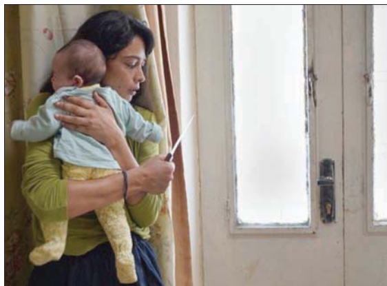
لقطة أخرى من فيلم «صالون هدى»

الهوية الثقافية، وحسبما يؤكد: «نحن تحت احتلال يهدف إلى تهجير الفلسطينيين عن الأرض، وإذا لم يستطع ذلك، فهو يعمل على محو هويته، وعلى رأسها الهوية الثقافية. وتعد السينما جزءاً مهماً من هذه الثقافة تبقى الشعب حياً في إنتاجه الثقافي والعلمي؛ فشكسبير كتب مسرحيات لا تزال مستمرة حتى يومنا، لأنه تناول قضايا إنسانية عميقة وهذا ما حاول فعله، تقديم دراما تتجاوز فكرة الزمن، وهذا ما يكسر الاحتلال أكثر وأكثر». خاص أبو أسعد تجربة العمل في هوليبود من خلال فيلم «جبل بيننا»، الذي لعبت بطولته كيت وينسلت وإدريس ألبا. وهو يؤكد أنّ لديه مشروعات لأفلام أخرى، قائلاً: «كورونا عطلت كل المشروعات، ولدي أعمال أفلام أتطلع للبدء بها خلال 2022». دخل أبو أسعد طرفاً في أزمة فيلم «أميرة» التي تفجرت أخيراً، بصفتها مستشاراً للفيلم وشريكاً إنتاجياً، مدافعاً عن المخرج محمد دياب، ومتضامناً مع الأسرى في الوقت ذاته، ويقول: إنّ «محمد دياب مخرج رائع، لي الشرف