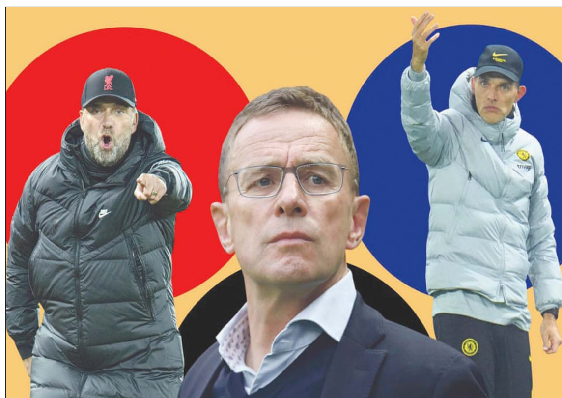
من اليمين... توخيل وارانغنيك وكلوب

الكبير الذي قام به مع تشيلسي. وعلاوة على ذلك، قام توخيل بعمل ممتاز مع بوروسيا دورتموند وكان ذكواؤه الخططي والتكتيكي واضحاً للجميع. ورغم أن هذا النجاح لم يستمر في نهاية المطاف، لكن لم يتم التشكيك قط في قدراته التدريبية. لقد كان بوروسيا دورتموند بقيادة توخيل يعتمد على الضغط العالي بالفعل، لكنه كان يعرف جيداً متى يجب تدوير ونقل