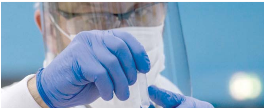
بريطانيا تتوقع أن يصبح «أوميكرون» مهيمناً في ديسمبر الحالي

«بعواقب» تطال الذين انتهكوا القواعد. ونشرت صحيفة «صندي ميرو» أمس، صورة لبوريس جونسون أمام شاشة في مكتبه وهو يحاط بمساعدين، وضع أحدهما إصبعاً حول عنقه فيما يعتمد الآخر قبعة عند الميلاد، خلال مسابقة أقيمت عبر الفيديو مع آخرين في غضون ذلك، اتهم رئيس الوزراء بوريس جونسون بترزع ثقافة تجاهل القواعد» داخل الحكومة بعد نشر صورة له أمس يظهر فيها وهو يشارك في مسابقة افتراضية في ديسمبر (كانون الأول) 2020 في فترة كان فيها البريطانيون محرومون من النشاطات الاجتماعية. وتُضاف هذه الواقعة إلى سلسلة من الفضائح التي طالت مصداقية جونسون المحافظ في وقت يطلق فيه من البريطانيين الالتزام بقواعد جديدة لمكافحة التفشي السريع لمتحور «أوميكرون» في البلاد.