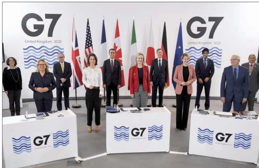
وزراء خارجية دول «مجموعة السبع» خلال اجتماعهم في ليفربول أمس (أ.ب)