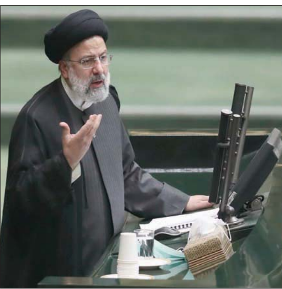
رئيسي يلقي كلمة عن الموازنة الجديدة في البرلمان أمس

ويعرف السعر المدعوم حكومياً باسم «دولار جهانغيري»؛ في إشارة إلى خطة إسحاق جهانغيري، نائب الرئيس السابق، وبدات الحكومة السابقة في 9 أبريل (نيسان) 2018 تطبيقها بهدف السيطرة على أزمة الدولار، قبل أن يخصص لدعم شراء السلع الأساسية، وتلبية حاجات بعض الوزارات، مثل وزارة الصحة.