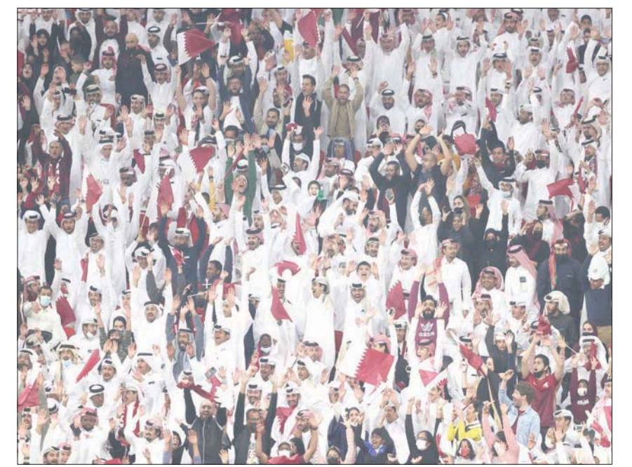
450 ألف مشجع شهدوا مباريات كأس العرب حتى الآن