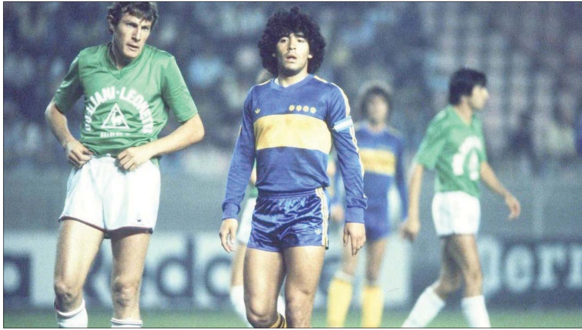
«كأس مارادونا» ستشهد عرض فيلم وثائقي لحياة الأسطورة الأرجنتيني (الشرق الأوسط)

بثلاثية نظيفة، لينجح في التفوق الكبير على غريمه الأرجنتيني ب3 انتصارات خلال 3 مباريات؛ منها انتصار بالترجيحية. وارتدى مارادونا قمصان فريق أرجنتينوس جونيورز، وبوكا جونيورز، وبرشلونة، ونابولي، وإشبيلية، ونيولز أولد بويز، قبل اعتزاله كرة القدم نهائياً في صفوف بوكا. ولعب مارادونا لصالح برشلونة في 36 مباراة رسمية خلال الفترة من 1982 وحتى 1984 نجح خلالها في التتويج ب3 بطولات؛ هي: كأس ملك إسبانيا لعام 1983، وكأس الدوري الإسباني لعام 1983، بالإضافة لبطولة كأس السوبر الإسباني لعام 1983.