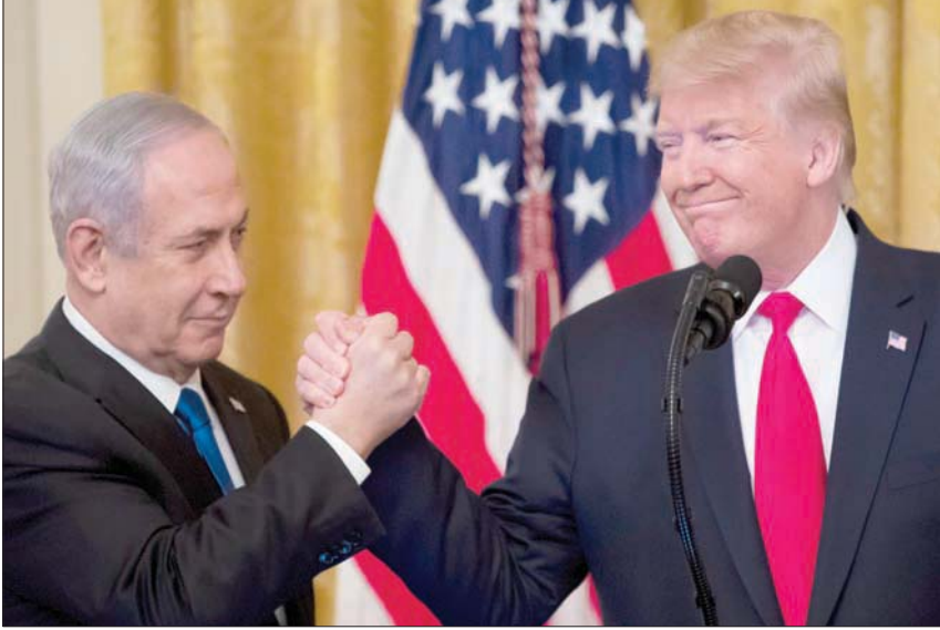
ترمب و نتنياهو في مايو (أيار) 2017 بعد خطاب للرئيس الأميركي السابق بالقدس (إب.أ)

معه، وأتاح له الوصول إلى منصب رئيس حكومة، بموجب الاتفاق، وكانت الأمور تستير بشكل أسهل بكثير». وأضاف: «بيني غانتس أعجبني كثيراً. أعتقد أنه كان راعياً. لقد جاء إلى البيت الأبيض، وأبدى آراء معتدلة كان بالإمكان أن تقضي إلى إبرام اتفاق مع الفلسطينيين؛ الفلسطينيون يكرهون نتنياهو، يكرهونه بشدة، ولكنهم لم يكرهوا غانتس، لم يكرهوه، وقد قلت لجاريد (كوشنر، صهره كبير مستشاريه) وديفيد (فريدمان، السفير الأميركي لدى إسرائيل آنذاك)، إنه إذا أصبح هو الرجل، إذا فاز سيكون الأمر أسهل بكثير». يذكر أن ترمب كان قد بدأ لقاءاته الصحافية مع الإعلام الإسرائيلي بمقابلة مطولة مع الصحافي باراك رافيد، المعلق السياسي في موقع «واللا»، الذي يعد كتاباً عن ترمب وصفقة القرن، بعنوان «سلام ترمب». وحسب مقتطفات من المقابلة نشرت في نهاية الأسبوع، عد وسائل الإعلام العبرية، عد الرئيس الأميركي السابق رئيس الوزراء الإسرائيلي السابق نتنياهو «مخادعاً خائناً»، وشتمته قائلاً إنه «لم يفعل أحد أكثر مني لبيبي. لقد أحببته، ولم زلت أحبه، ببساطة، بل فعل ذلك بواسطة مقطع فيديو. لقد شعرت بخيبة أمل شخصية من؛ كان يجب أن يكتب خطاباً بعد صامتاً. لقد ارتكب خطأ فادحاً. أعتقد أن إسرائيل كانت ستكون مدمرة بحلول هذا الوقت، لولا قراراتي ضد الاتفاق مع إيران».