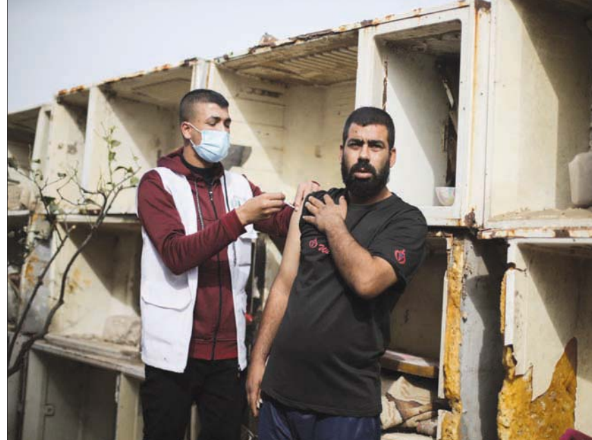
تطعيم ضد كورونا في أحد الأبنية التي تنتظر إعادة الإعمار في قطاع غزة

مصر الشقيقة بمنحة 500 مليون دولار، وقطر الشقيقة بمنحة 500 مليون دولار، بالإضافة إلى منحة من دولة ألمانيا بقيمة 9 ملايين دولار، ويخص المنح المختلفة المقدمة من دول ومؤسسات دولية ومحلية، تقدر بقرابة 20 مليون دولار». وقال سرحان إن جمهورية مصر العربية، بدأت بإنشاء شارع الكورنيش بطول 1,8 كيلومتر شمالي مدينة غزة، بالإضافة إلى إعداد المخططات لثلاثة تجمعات سكنية إجمالية يزيد على 3000 وحدة سكنية، وإعداد أيضاً المخططات لعدد 2 كوبري في منطقة الشجاعة والسرايا، فيما