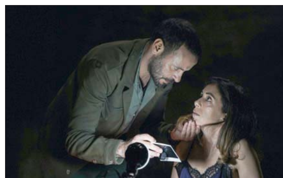
لقطة من فيلم «صالون هدى»

يقاوم بكل السبل، وقد سعدت بان يفتتح فيلمي عروض الأفلام في مهرجان البحر الأحمر، فإسباسة اليوم تحاول ألا تكون قضية فلسطين قضية مركزية، والصهيونية التي زرعت في فلسطين لم تكن فقط من أجل الاستيلاء على أرضنا، بل أيضاً لإضعاف العالم العربي». يتمتع فيلم «صالون هدى» بإيقاع محكم ومتوازن من البداية للنهاية، لمخرج اعتاد كتابة سيناريوهات أفلامه، وحسبما يؤكد أبو أسعد: فإنّ «السيناريو هو العمود الفقري للفيلم وهو الذي يحدد إيقاعه، لعل أكثر شيء أحبه هو كتابة السيناريو