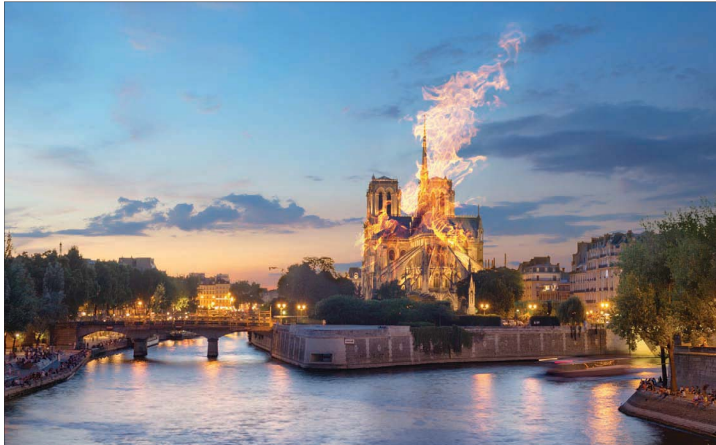
حريق كاتدرائية «نوتردام» باريس في 15 أبريل 2019