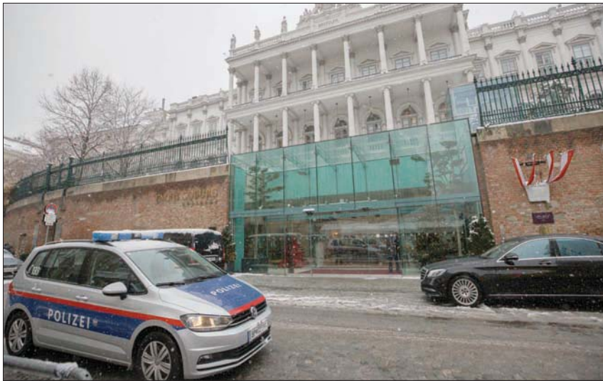
سيارة شرطة أمام قصر كوبورغ بفيينا حيث عقد اجتماع لبحث الملف النووي الإيراني الخميس