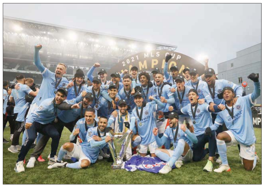
لاعبو نيويورك سيتي يحتفلون بالتتويج بأبطالاً للدوري الأميركي

قال: «المرء يتقدم بالعمر، إلا أن الجمهور أصر وشجاعي على فعل ذلك، فلبيت النداء احتفالاً معهم باللقب الأول للنادي» الذي كان يخوض أصلاً مباراة اللقب للمرة الأولى في تاريخه، حارماً بورتلاند من لقب ثانٍ، بعد الذي أحرزه عام 2015. ووصل «نيويورك سيتي إف سي» إلى مباراة اللقب بعد فوزه في نهائي المنطقة الشرقية على فيلادلفيا يونيون بنتيجة (2-1)، في حين تغلب بورتلاند تيمبرز في نهائي المنطقة الغربية على سولت لاك سيتي بنتيجة (2-صفر). وهذه هي المرة الخامسة التي يُحسم فيها الدوري الأميركي بركات الترجيح في عمر المسابقة التي شهدت نسختها السادسة والعشرين.