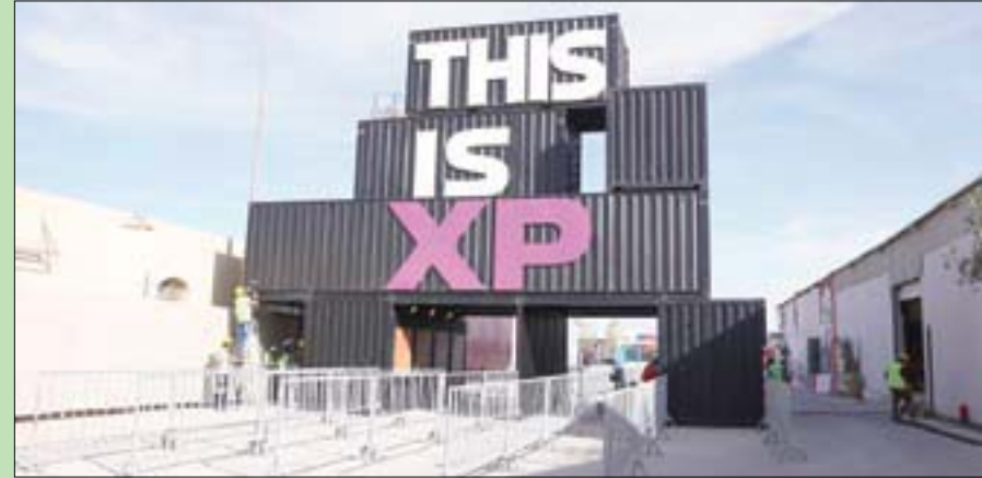
جانب من استعدادات مؤتمر «إكس بي ميوزيك فيوتشرز» في الرياض

تستعد العاصمة السعودية الرياض هذا الأسبوع لاستضافة أكبر حدث موسيقي على مستوى الشرق الأوسط الممثل في مهرجان «ساوند ستورم»، وذلك خلال الفترة من 16 إلى 19 ديسمبر (كانون الأول) 2021، بمشاركة أكثر من 200 فنان محلي وعربي وعالمي.