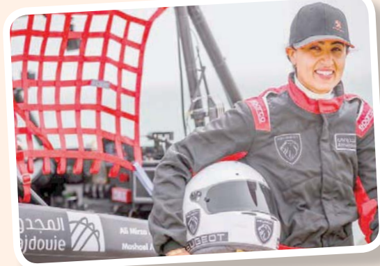
مشاعل العبيدان (الشرق الأوسط)

وأقيمت المرحلة الأخيرة بمسافة 148 كيلومتراً فقط، لكنها كانت حاسمة لكونها تتطلب من متسجري الفئات القيادة بأمان حتى خط النهاية لضمان فوزهم. وفاز ناصر من الناحية الحسابة، باللقب العالمي بعد أن نجح في تسجيل أسرع الأوقات في مرحلتين سابقتين، الأولى والثالثة، لكنه واصل، بمساعدة ملاحه الفرنسي ماتيو بوميل، الضغط لتسجيل من مزيد من الانتصارات بالمرحل ومعهما الفوز بالرالي، وأنها الرالي الأول مُتقدمين بفارق 21:51 دقيقة عن أقرب مُلاحقهم، الثنائي الروسي السائق رئيس كروفوف والملاح قسطنطين جيلستوف.