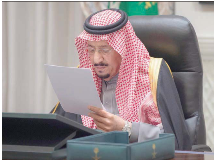
خادم الحرمين الشريفين الملك سلمان بن عبد العزيز خلال جلسة إقرار الميزانية السعودية أمس

المالية والاقتصادية تؤكد أننا نتقدم بشكل إيجابي؛ حيث تأتي ميزانية العام المقبل وسط مناخ عالمي يتسم بالتحديات الكبيرة التي سيشهد العالمها خلال العام الماضي، مشيراً إلى توقع تحقيق فوائض في الميزانية للعام المالي المتاحه بما يحقق أفضل عائد منها، مع الحفاظ على الاستقرار المالي كركيزة أساسية للنمو المستدام». وأكد ولي العهد أن التعافي الاقتصادي والمبادرات وسياسات