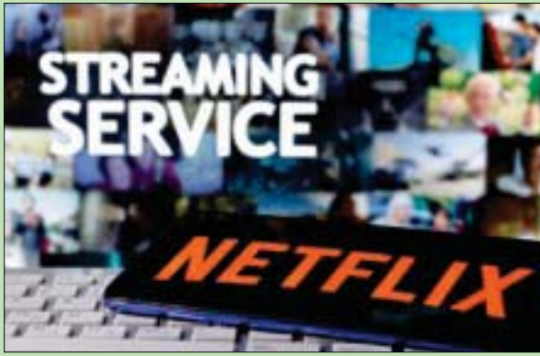
شعار نتفليكس

سان فرانسيسكو، «الشرق الأوسط» وسبق قدم موقع «تادوم» محتوي إضافياً ومعلومات عن البرامج التلفزيونية والأفلام التي ستعرضها خدمة «نتفليكس». على سبيل المثال أشارت المنصة للمستخدمين عن التحديدات وتواريخ الإصدار وإعلانات برامجها التلفزيونية وأفلامها الجديدة. وتسوق «نتفليكس» الموقع الجديد باعتباره «مكاناً لاكتشاف المزيد عن تفضيلات (نتفليكس)»، «الساحر»، أو هل حلقات «مايد» تستند إلى قصة حقيقية. كما يعرض الموقع مقابلات حصرية ومعلومات عن المحتوى ذي الشعبية على منصة «نتفليكس». ويمكن الوصول إلى الموقع حالياً من مختلف أنحاء العالم، لكنه متاح الآن باللغة الإنجليزية فقط. ومن غير المعروف ما إذا كانت «نتفليكس» تعتزم إضافة لغات أخرى إليه في المستقبل.