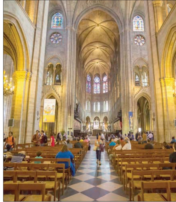
سائحون يزورون كاتدرائية «نوتردام» في باريس

يقول شوفيه: إنّ «الفكرة (نوتردام) في المقام الأول» هي أنّ المؤمنين أو الزوار، تذلهم عظمة وجمال