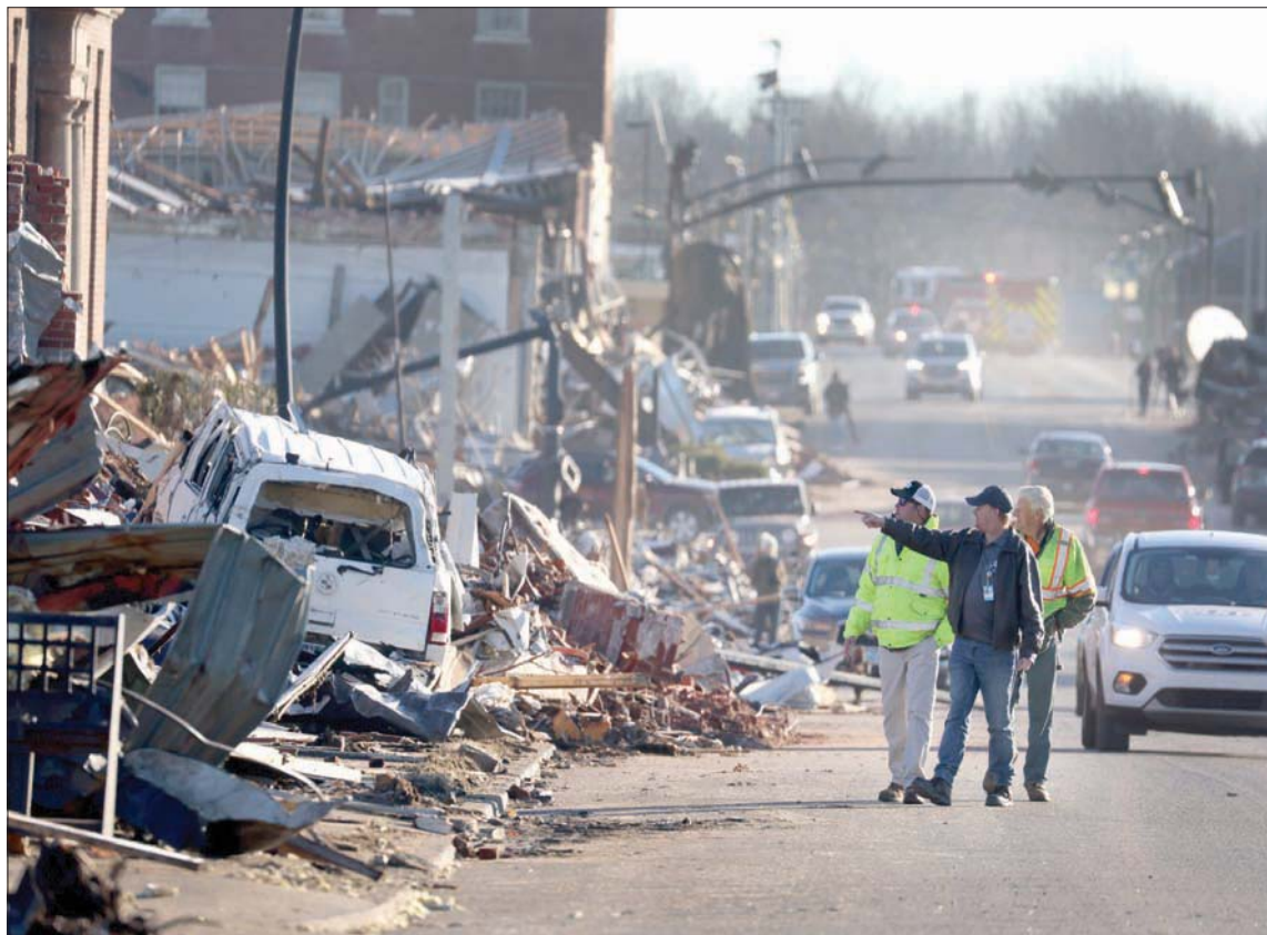
جانب من الدمار الناجم عن الإعصار في مدينة مايفيلد بولاية كنتاكي أمس

لندن، الشرق الأوسط، أصيب مؤسس موقع «ويكيليكس» جوليان أسانج (50 عاماً) بجلطة دماغية طفيفة في نهاية أكتوبر (تشرين الأول) الماضي في السجن في خضم معركة قانونية ضد تسليمه من المملكة المتحدة إلى الولايات المتحدة، حسبما أكدت خطيبته ستيفلا موريس. وقالت موريس إن أسانج أصيب بجلطة دماغية طفيفة في 27 أكتوبر في اليوم الأول للنظر في استئناف أمريكي ضد رفض تسليم مؤسس موقع «ويكيليكس» الذي تريد واشنطن محاكمته على خلفية تسريب لعدد هائل من الوثائق. وأسانج محتجز منذ سنتين ونصف في سجن بيلمارش الخاضع لحراسة أمنية مشددة شرق لندن حيث نقل فور إخراج كل هذا تسبب بجلطة دماغية لجوليان في 27 أكتوبر، معربة عن خوفها من أن يعاني خطيبها من جلطة دماغية خطيرة أكثر. ويأتي الكشف عن الحالة الصحية لأسانج بعد انتصار كبير للولايات المتحدة في معركتها للحصول على تسليم مؤسس موقع «ويكيليكس» عندما ألت محكمة استئناف لندن قرار المحكمة الابتدائية بمنع تسليمه إلى واشنطن. ويعتزم جوليان أسانج استئناف الحكم أمام المحكمة العليا. وعُرف أسانج بشكل واسع عام 2010 حين سرب أكثر من 700 ألف وثيقة سرية متعلقة بحربي العراق وأفغانستان بينها أكثر من 250 ألف برقية دبلوماسية جفنه الأيمن. وقالت الصحفية إنه يأخذ أدوية منذ ذلك الوقت. وقالت ستيفلا موريس: «أعتقد أن لعبة الشطرنج هذه المستمرة، معركة تلو أخرى، وهذا الضغط الشديد،