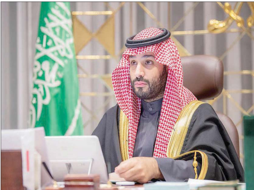
ولي العهد السعودي الأمير محمد بن سلمان خلال جلسة مجلس الوزراء أمس لإقرار ميزانية الدولة للعام الجديد

وفي ختام تصريحه، أشار ولي العهد السعودي إلى أن نجاح الحكومة في التصدي للجانحة والحد من أثارها الاقتصادية والاجتماعية يثبت قوة اقتصاد المملكة في مواجهة التحديات الطارئة، وأنها تعمل على دعم الدول الشقيقة والمنظمات الدولية في جهودها لمواجهة الأزمة، وأكد على الدور الريادي الذي تقوم به المملكة في استقرار أسواق الطاقة، وفي نفس الوقت قيادة الحقبة الخضراء المقبلة، مشيراً إلى أن «مبادرة السعودية الخضراء»، و«مبادرة الشرق الأوسط الأخضر»، ترسمان توجه المملكة والمنطقة في حماية الأرض والطبيعة ووضعها في خريطة طريق ذات معالم واضحة وطموحة، وستسهمان بشكل قوي في تحقيق المستهدفات العالمية، كما ستستمر المملكة خلال العام المقبل، وعلى المدى المتوسط والطويل، في زيادة جاذبية اقتصاد المملكة كقاعدة للاستثمارات المحلية والأجنبية، وتنويع الاقتصاد عن طريق تطوير القطاعات الواعدة كالسياحة والتقنية والصناعة والتعدين.