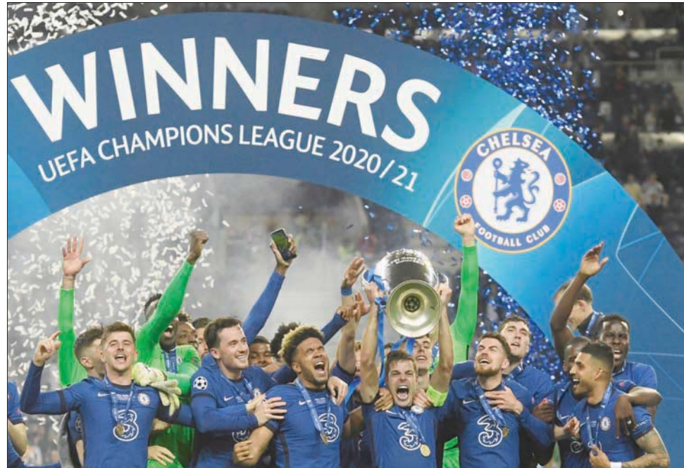
احتلال تشيلسي للمركز الثاني بمجموعته بئذ بمشوار صعب للدفاع عن اللقب

ليفربول اللذين يعتبران المرشحين الأوفر حظاً للفوز باللقب بعدما أنهى الفريقان دور المجموعات بالعلامة الكاملة، على غرار أياكس أيضاً، لكن الأخير كان في مجموعة أقل صعوبة تضم دورتموند وبشكتاش التركي وسبورتنغ. ويصني عشاق اللعبة من المحايدين أن يقع سان جيرمان في مواجهة يونايك في لقاء سيجمع ميسي بغريمه البرتغالي كريستيانو رونالدو المعاد هذا الموسم إلى «الشياطين الحمر»، بعد رحيل أسطورة ريال السابق عن يوفنتوس الذي سيكون أيضاً من الخيارات أمام نادي العاصمة الفرنسية في مواجهة تشكّل عقدة للأخير، إذ لم يسبق له أن فاز على عملاق تورينو في مواجهة الثماني التي جمعتهم سابقاً (6 هزائم وتعادلان). بغض النظر عن هوية المنافس، فإن هدف سان جيرمان ومالكه القطريين الذهاب حتى النهاية وإحراز اللقب الذي أفلت منهم عام 2020 بخسارته في النهائي أمام بايرن، وشدد لاعبه الجديد المغربي أشرف حكيمي بالقول: «ههنا هو الذهاب حتى النهاية مهما كان المنافس الذي نواجهه».