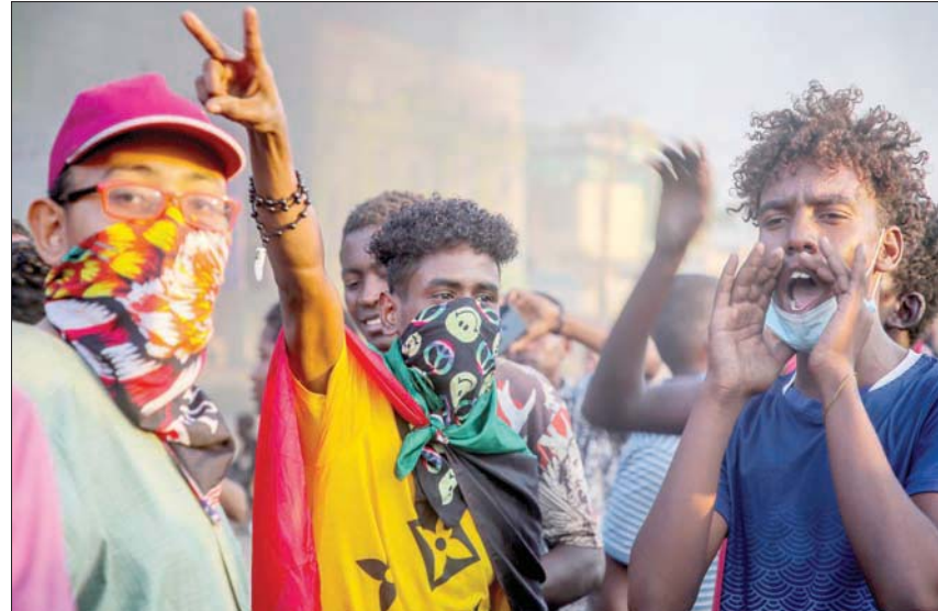
«لجان المقاومة» السودانية ترفض اتفاق حمدوك مع البرهان وتطالب بنقل السلطة للمدنيين