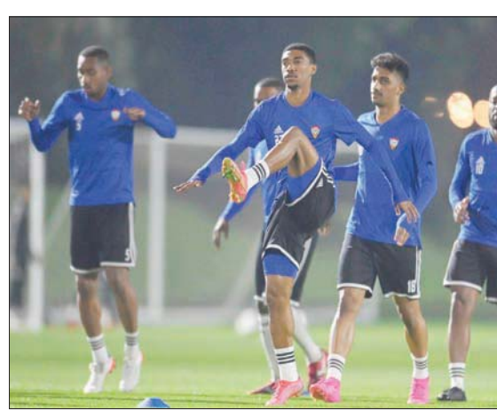
من استعدادات الإمارات للمواجهة العربية (الشرق الأوسط)

أما فريق الفيحاء فيدخل مباراته أمام الهلال بعد تعادله الأخير أمام التعاون والذي حضر عبد العزيز بن مساعد بمدينة حائل، حيث يتطلع صاحب الأرض لتحقيق نتيجة إيجابية تساهم