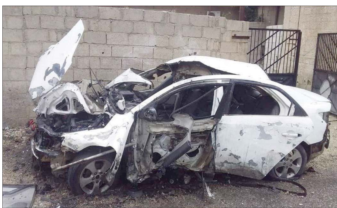
سيارة بعد تفجيرها في ريف درعا جنوب غربي سوريا أمس (الشرق الأوسط)

أحد المخطوفين المتحدر من دمشق في السويداء يوم الاثنين الماضي، معظم هذه الحالات تقوم بها عصابات معروفة في المنطقة لا يتم التعاطي معها من الجهات الحكومية أو المسلحة محلياً، خوفاً على حياة الشخص المخطوف والمحتجز لديهم، بحكم أنهم نفذوا عدة عمليات قتل بحق مخطوفين في أكثر من مرة. تشير التقارير والتوثيقات المحلية الصادرة من جنوب سوريا في درعا والسويداء إلى استمرار معاناة المواطنين المدنيين والعسكريين من عمليات الإنفلات الأمني التي تضفي بظلالها منذ سنوات على المنطقة، رغم ما حل بها من تغيرات مناخية على طبيعة القوة المسيطرة وسياسة تعامل النظام السوري معها. إلا أن مشهد الإنفلات الأمني وكما عرفت منذ سنوات الموقوف، رغم تطبيق تسويات جديدة وخارطة جديدة روسية جاءت للمنطقة التي خضعت للتسويات في عام 2018 من الحيف الذي سمحت روسيا حينها بحام 2018 لفصائل الجبهة الجنوبية المعارضة في درعا والقنيطرة ببقائه معهم بعد سحب السلاح الثقيل والمتوسط منهم.