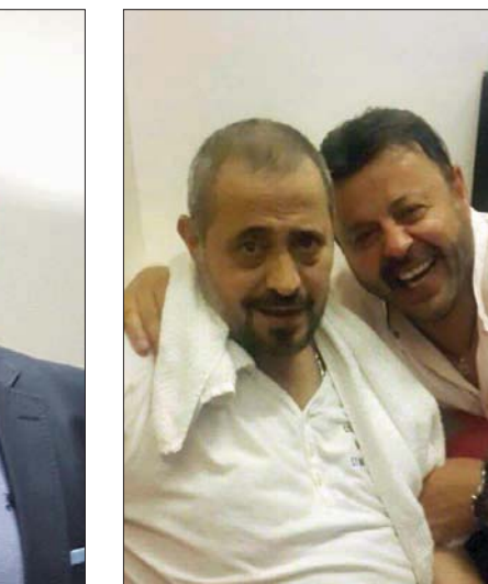
إيلي أيوب مع جورج وسوف