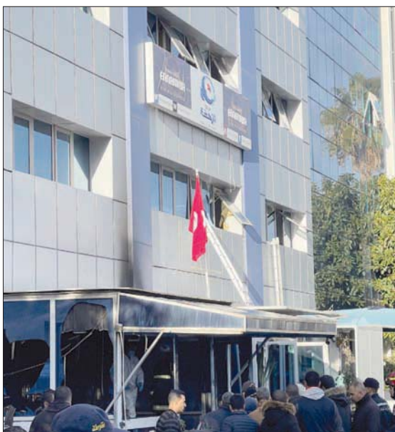
واجهة مقر حركة النهضة إثر تعرضه لحريق أمس وسط العاصمة التونسية

في سياق ذلك، ذكرت مصادر مقربة من حركة النهضة أن المتسبب في الحريق سجين سياسي سابق، جاء إلى مقر حركة النهضة لمقابلة علي العريض، ومطالبتة بتوفير عمل له، بعد أن تعرض لضائقة مالية، مؤكدة أن المتهم قضى سنوات طويلة في السجن، وجاء بحرق بالغة. أما علي العريض، فقد وصلت إلى مكتبه السنة النيران من الدخان، ما أدى إلى اختناقه، فرمى نفسه من الطابق الثاني ليصاب