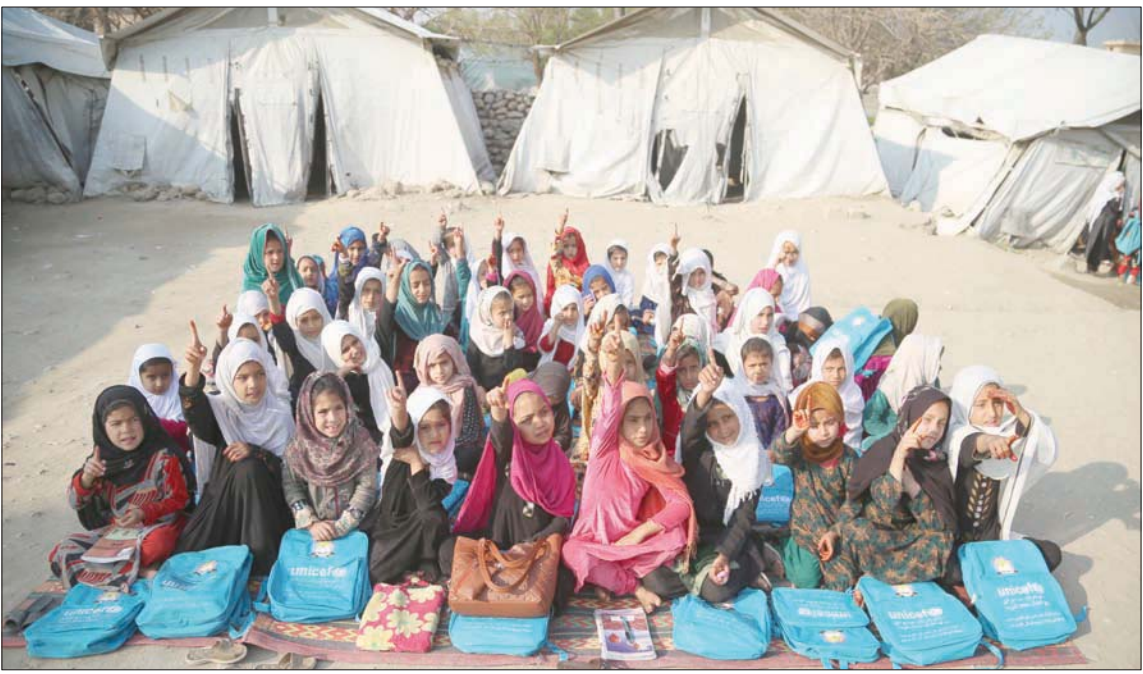
عدد الأطفال الذين يحصلون على الخدمات الأساسية في انخفاض