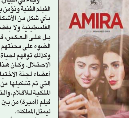
ملصق فيلم أميرة