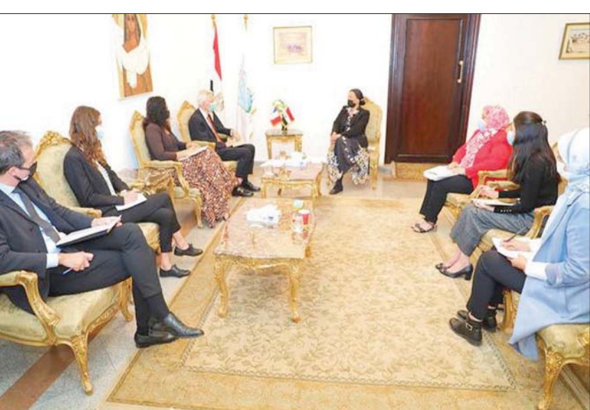
وزيرة البيئة المصرية مع سفير فرنسا بالقاهرة لبحث التعاون المشترك

العمل المناخي، حيث وضع وزير المالية في مصر البيئة والمناخ على قائمة أولويات وزارته. بالإضافة إلى العديد من الوزارات المصرية كالتنمية المحلية والتخطيط، مما يعني مزيداً من الدعم لمشروعات المناخ على المستوى الوطني». من جانبها، أكد السفير الفرنسي «تطلع بلاده لدعم مصر في استضافتها لمؤتمر المناخ القادم، والعمل على إنجاز المؤتمر، وتحقيق مصالح جميع الأطراف، وذلك في ظل الاهتمام الفرنسي بقضايا البيئة، وخاصة تغير المناخ. إلى جانب الاهتمام بالحد من تلوث الهواء، ودعم مصر في جهودها في هذا المجال». يشار إلى أن آخر نسخة من قمة المناخ، والتي حملت اسم «COP26»، واستضافتها مدينة غلاسكو باملكة المتحدة الشهر الماضي، دعت إلى «التسريع بالتخلص التدريجي من الفحم، وتخفيض انبعاثات غازات الاحتباس الحراري».