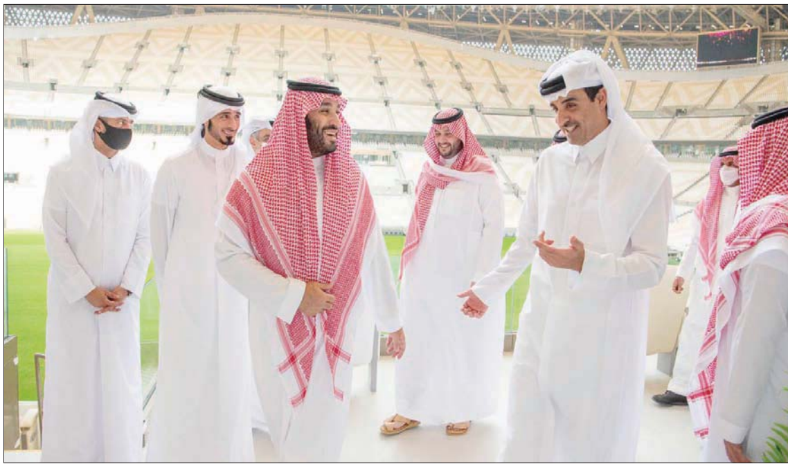
ولي العهد السعودي وأمير قطر خلال جولتهما في استاد «لوسيل»

وتستضيف قطر حالياً بطولة كأس العرب تحت رعاية وإشراف الاتحاد الدولي (فيفا) التي تأتي بمثابة استكشاف لاستعداد العاصمة القطرية الدوحة وجاهايتها لاحتضان المونديال القادم. ويعد «استاد البيت» ثاني أكبر ملاعب مونديال قطر وتم افتتاحه في بطولة كأس العرب الحالية في المباراة التي جمعت بين منتخب قطر والبحرين، وسيختم الصرح الرياضي