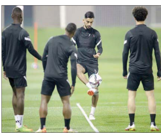
قطر تمنى النفس بمواصلة طريقها نحو اللقب

لكن عمان لن تكون لقمة سائغة، خصوصاً أنها قدمت مستويات لافتة في دور المجموعات،