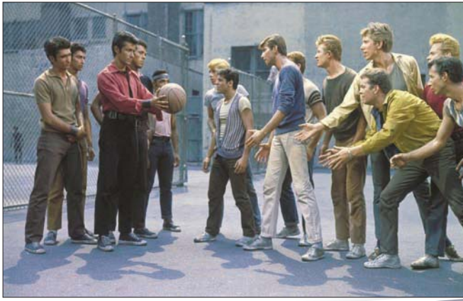
«وست سايد ستوري» نسخة 1961