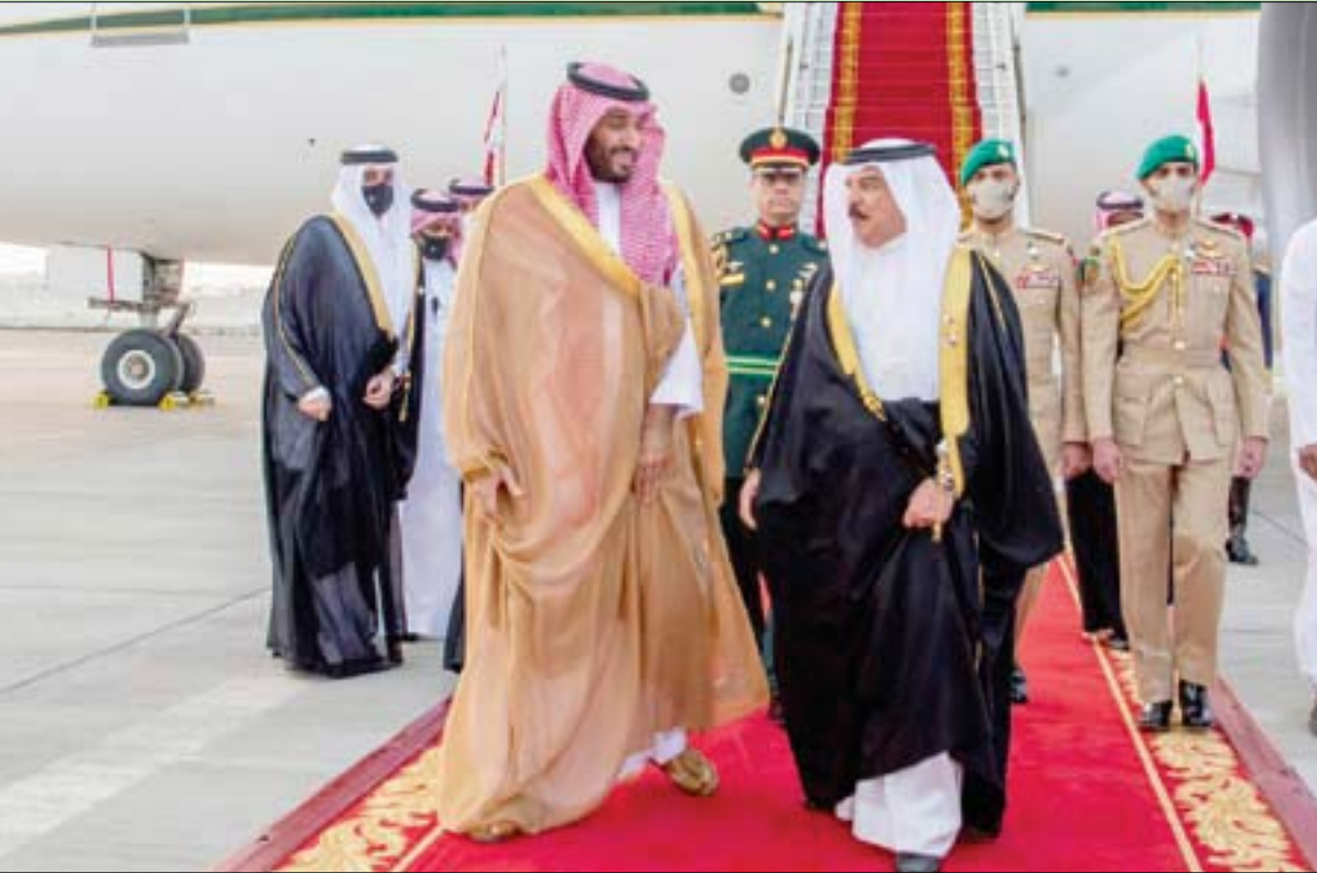
الملك حمد بن عيسى في مقدمة مستقبلي الأمير محمد بن سلمان لدى وصوله إلى العاصمة البحرينية أمس