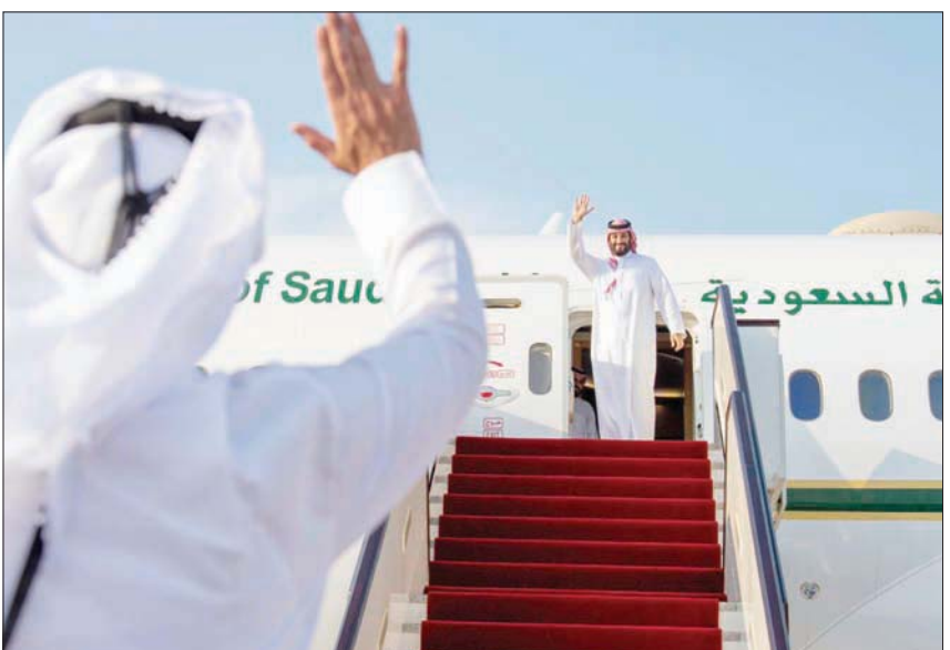
أمير قطر مودعاً ولي العهد السعودي في مطار الدوحة أمس (واس)

على تنمية العلاقات السياسية والاقتصادية والتجارية والتعاون والعمل المشترك، وقال: «هناك حرص دائم من جانب قيادتي البلدين على توثيق هذه العلاقات ودفعها باستمرار نحو آفاق جديدة من التطور والتكامل». وأضاف السفير السعودي أن العلاقات التاريخية بين المملكتين تتسم باستمرارية التواصل والود والحمية بين قيادتي وشعبي البلدين، وتشهد تطورا في كل المستويات، انطلاقاً من الثوابت والرؤى المشتركة التي تجمع بينهما تجاه مختلف القضايا وروابط الأخوة ووشائج القرى والمصاهرة والنسب ووحد المصير والهدف المشترك، التي تجمع بين شعبيهما، فضلاً على حوارهما الجغرافي وعضويتهما في مجلس التعاون لدول الخليج العربية وجامعة الدول العربية،