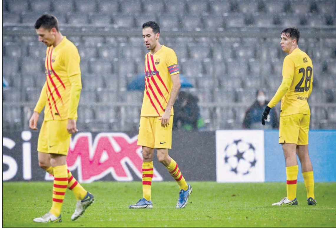
مسيرة حزينة لبرشلونة بعد توقيع دور الأبطال (إب.أ)

لأحت لنا بعض الفرص الرائعة لكننا لم نسجل، لذا فإننا تعثرنا بعض الشيء في هذه المواقف». وأشار إلى أنه «بعد أن استقبلت شباننا هدف التعادل لم ندافع بشكل كاف أو نلعب بأداء متحفظ، إذا انتهت المباراة بالتعادل 4 - 4 لم يكن أحد سيذم»، وأكد رانينيك: «دفعنا بعدد من الوجوه الجديدة ومنحننا المزيد من الوقت للاعبين كانوا في أمس الحاجة للمشاركة، لن أقول أنني سعيد لكن الأمور على ما يرام».