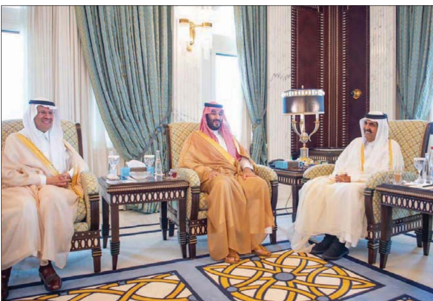
الأمير محمد بن سلمان لقائه الشيخ حمد بن خليفة آل ثاني في الدوحة أمس

على تضامن دول المجلس، وعمق الروابط بين شعوب المجلس. وكان الأمير محمد بن سلمان، اختتم في وقت سابق من يوم أمس، زيارة رسمية لدولة قطر، حيث وزعه في مطار الدوحة الدولي الشيخ تميم بن حمد آل ثاني أمير البلاد، وكبار المسؤولين القطريين. ولدى مغادرته الدوحة، بعث الأمير محمد بن سلمان ببرقية، ضمنها شكره وتقديره لما لقيه والوفد المرافق من حفاوة الاستقبال وكرم الضيافة، وقال: «لقد أكدت هذه الزيارة والمباحثات التي أجريتها مع سموكم مائة العلاقات الأخوية بين بلدينا، والرغبة المشتركة في تعميق التعاون بينهما في المجالات كافة، في ظل قيادة سيدي خادم الحرمين الشريفين الملك سلمان بن عبد العزيز آل سعود وسموكم، والتي تهدف إلى تحقيق مصالح البلدين والشعبين الشقيقين، متمنياً لسموكم موفقو الصحة