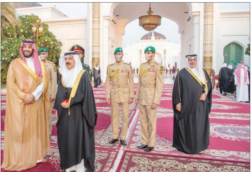
الملك حمد بن عيسى مستقبلاً الأمير محمد بن سلمان في قصر الصخبر

وأضاف أن زيارة الأمير محمد بن سلمان تأتي انطلاقاً من العلاقات الأخوية التاريخية الوطيدة الممتدة إلى الصعيدين الرسمي والشعبي، التي تربط دولة الكويت بالمملكة العربية السعودية، وتعزيزاً لأواصر الحوادة التي تجمع قيادتي وشعبي البلدين.