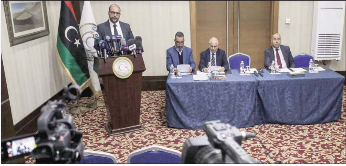
جانب من مؤتمر صحفي عقده المجلس الأعلى للدولة في طرابلس أول من أمس