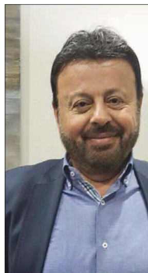
إيلي أيوب: إضحك الناس صعب

بيروت، فيزيان حداد يفتقد اللبناني في ظل الأزمات المتراكمة التي يعيشها الضحكة النابعة من القلب. كانت أزمات، صلاحة أكبر اليوم تامين لكمة عيشه. هذه الضحكة التي كانت تلون ليلي اللبنانيين من خلال العروض الساخرة الانتقادية، على الشاشة الصغيرة وخشبة المسرح، تغيب اليوم كلياً. لعل فن المونولوج الذي يعتمد على الأغنية الساخرة والنكتة الطريفة والأداء خفيف الظل، هو أكثر الممثلين بالأجواء القاتمة السائدة في البلاد، فهو يشهد تراجعاً ملحوظاً، بحيث تغيب أي إنتاجات جديدة. كما ترك فراغاً في حفلات المطربين الذين ما عادت السهرات التي يحيونها تشمل هذا الفن. في الماضي كانت فكرة المونولوج تشكل عنصراً أساسياً في برنامج حفل غنائي. أرباب المونولوج أمثال إيلي أيوب، وسامون نعيم، وجورج حريق، ورولا شامية، كانوا أبرز نجومه. وأسهمت الفنانة الراحلة فريل كريم في وضع مدمك أساسي في هذا الفن. فهي كانت نجمة المونولوج الأولى في لبنان في السبعينات والثمانينات. فحرفت طرافتها وخفة دمها وتلقها على خشبة، في ذاكرة اللبناني. حتى في العصر الذهبي لفن المونولوج كانت قلة من المواهب تتجده. ولذلك عرف بالوفد الصعب وبالدواء الشافي لهيوم الناس. اما عمر الزعي الذي لقب بـ«موليبر، الشرق»، فكان أول من أطلق المونولوج في لبنان باللغة المحكية. عكست أغانيه وقصائده بشكل متكرر الظروف الاجتماعية والسياسية والأحداث التاريخية التي أصابت لبنان والدول العربية المحيطة. كان الزعي يهدف من خلال فنّه إلى إيصال مشاكل الناس وهمومهم ومعاناتهم لأهل السلطة. لم تعجب السلطات اللبنانية بفن الزعي، ولم تبت