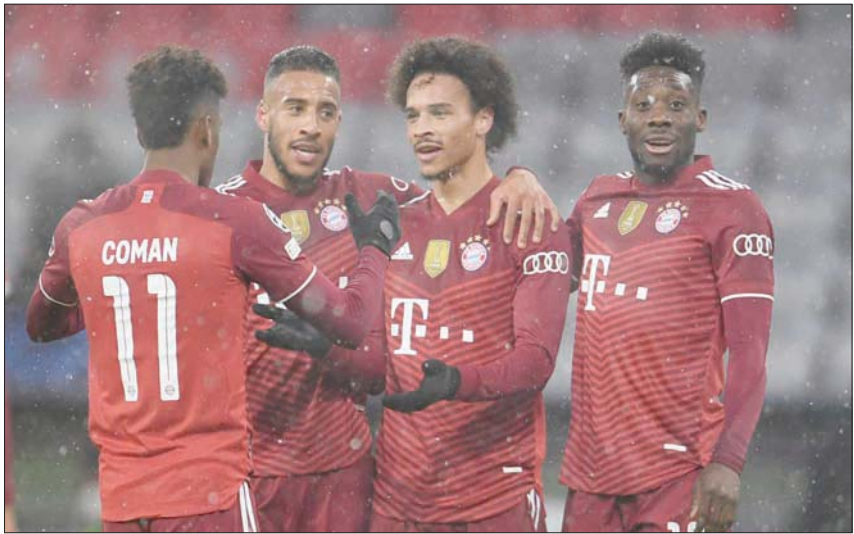
بايرن المنتشي أوروبياً بالفوز على برشلونة يخوض اختباراً صعباً أمام ماينز

كثيراً بعد فوزه 3 - 2 في الدوري المحلي، مطلع الأسبوع الحالي، على ملاحقه المباشر بروسيا دورتموند وتعزيز الفارق بينه وبين فريق المركز الثاني إلى أربع نقاط.