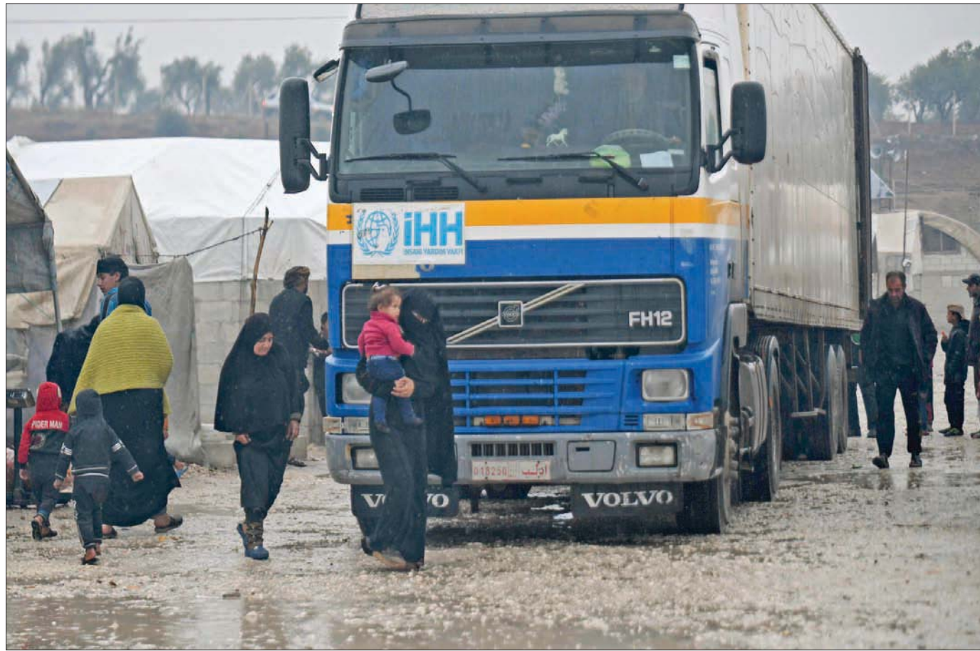
شاحنة تحمل مساعدات في مخيم للنازحين في عفرين شمال سوريا أول من أمس (أ.ف.ب)

بيروت - تل أبيب - لندن، «الشرق الأوسط» نقل موقع «والا» الإسرائيلي عن مسؤولين في تل أبيب قولهم إن «إسرائيل نجحت في تدمير 75 في المائة من الأسلحة الإيرانية في سوريا وحققت أقصى درجات الردع ضد القوات الإيرانية في سوريا وضد النظام السوري». وبحسب المسؤولين، فإن «الأسلحة المدمرة كانت موجبة لمليشيات موالية لإيران ومجموعات إيرانية على الأراضي السورية وحزب الله اللبناني وأن بعض الأسلحة المدمرة صنعت في إيران وتم تهريبها إلى سوريا براً وجواً وبحراً، وبعضها غير ضروري على الأراضي السورية نفسها». وذكرت أن الهجمات المنسوبة للجيش الإسرائيلي تشمل الأضرار التي لحقت بالطائرات من دون طيار بمختلف أنواعها، والصواريخ، ومكونات أنظمة الدفاع الجوي، والبنية التحتية لإنتاج الأسلحة وغيره. ويوم الثلاثاء، استهدف قصف إسرائيلي شحنة أسلحة إيرانية، في مرفأ اللاذقية قرب قاعدة حميميم التي تضم منظومة جوية متطورة، مما اعتبر بمثابة «ملاحقة» من تل أبيب لتهران في منطقة غرب «تحت المظلة الروسية» في سوريا. وأفاد «الرصد السوري لحقوق الإنسان» أن يوم الأربعاء، بان الصواريخ الإسرائيلية استهدفت «بشكل مباشر شحنة أسلحة