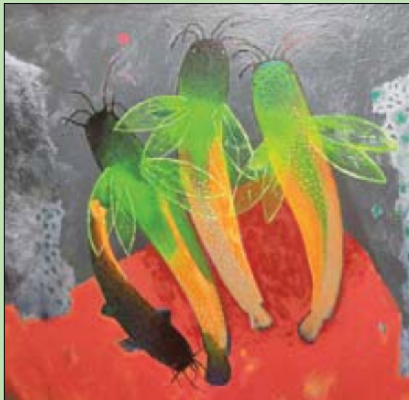
أسماك القراميط ترتبط بأسطورة إيزيس وأوزيريس