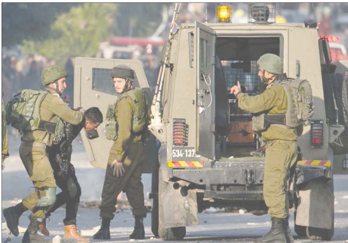
الاحتلال الإسرائيلي يعتقل 32 فلسطينياً في الضفة

نهاية الأسبوع الماضي، ضمن حملة استغرقت عدة ساعات، قد انتهت باعتقال 24 شخصاً. وتم تحذير 20 منهم، بمحاكمتهم إذا أقاموا علاقات مع ممثلي حماس في تركيا أو قطاع غزة، ثم أطلقوا سراحهم، فيما أبقيت المخابرات النشطة الأربعة المشتبه بأنهم أصبحوا جزءاً من التنظيم المسلح، وأكد مسؤول في المخابرات الإسرائيلية أن اقتحام بلدة صورييف تم بعد إبلاغ السلطة الفلسطينية من خلال المنظمة التنسيق الأمني بين الجانبين.