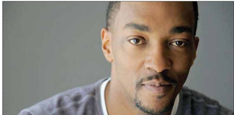
أنتوني ماكي بطل فيلم «محارب الصحراء»

طبيعية متعددة، بطبيعة الحال لا يمكن تصوير كل شيء خصوصاً تلك الأفلام التي عليها أن تقع أحداثها في بلدانها، لكن ما تطرحه المملكة هو استحوذ المشاريع العالمية الكبرى بعدما قامت بتأمين كل متطلبات العمل اللوجيستية منها والإدارية كما الفنية.