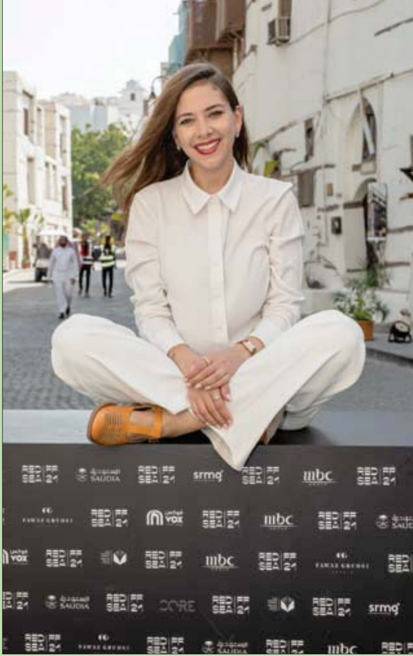
المثلة والمخرجة السعودية فاطمة البني في شارع بجدة القديمة «البلد» ضمن فعاليات مهرجان البحر الأحمر السينمائي الدولي الذي يقام في جدة حتى 15 ديسمبر (كانون الأول) الجاري...

لا عاقل يريد الحروب، لكن لا عاقل أيضاً لا يعدّ للأمر عدته ويحسب كل الاحتمالات.