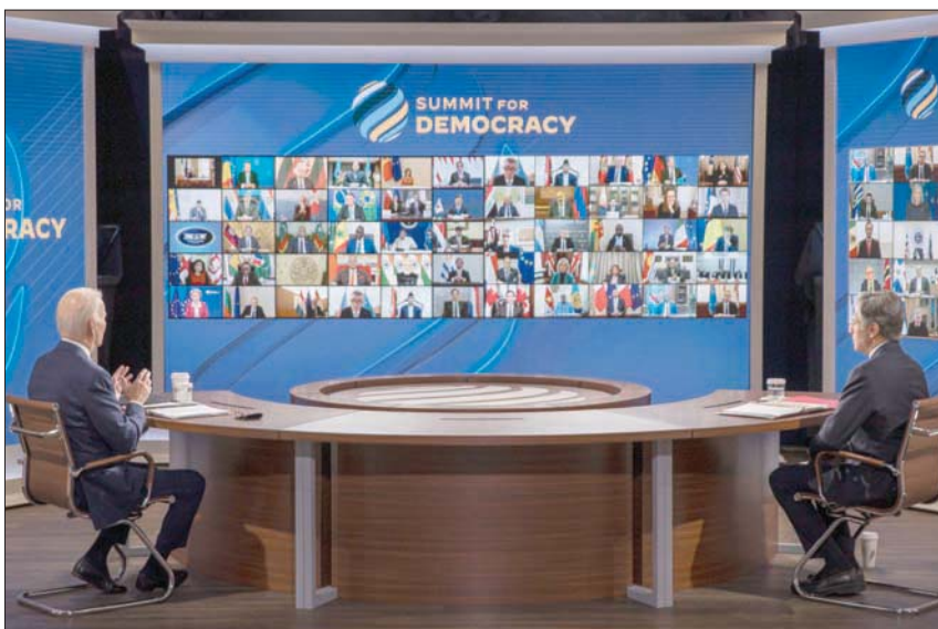
واشنطن، معاذ العمري

أعلن الرئيس الأميركي جو بايدن عن تخصيص 424 مليون دولار دعماً لمبادرة «التجديد الديمقراطي» العالمية، وذلك في استهلال كلمته أمس خلال قمة افتراضية «من أجل الديمقراطية»، دعا إليها أكثر من 100 دولة بهدف تعزيزها في جميع أنحاء العالم، وأشارت استبياء الصين وروسيا. ورغم التهديدات التي تواجهها الديمقراطية في الداخل الأميركي خصوصاً خلال الحملة الرئاسية الأخيرة، فإن الرئيس جو بايدن، يدعق بالمبادرات الداخلية والخارجية للحفاظ على «التماسك الديمقراطي» حول العالم، قائلاً إن «الحفاظ على الديمقراطية في العالم وتعزيزها هو التحدي الحاسم في عصرنا». وأفاد بايدن في كلمته من البيت الأبيض، أمام نحو 100 من قادة العالم، بأن مواجهة التحديات المستمرة والمعلقة للديمقراطية وحقوق الإنسان في جميع أنحاء العالم، «تحتاج إلى إبطال»، مشيراً إلى أنه يريد من هذا اللقاء إطلاق شرارة «عام من العمل» للدول المشاركة (110) المتابعة للالتزامات التي تم التعهد بها خلال الحدث الذي يستمر يومين (الخميس والجمعة). ولغقت إلى أن استراتيجية إدارته الجديدة لمكافحة الفساد، تقترح قواعد تجعل من الصعب على الفاعلين الفاسدين إنشاء شركات وهمية لغسل الأموال أو إخفاء الأصول، حالاً المشاركين على الدفاع عن العدالة وسيادة القانون، وحرية التعبير وحرية التجمع، وطالب بايدن خلال القمة من الحضور