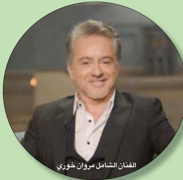
الغنان الشامل مروان خوري

هو عليها اليوم. يكمل البوح لـ «مدمام إسعاد» صبيان الصف على جعله يرتدي تنورة لتتناسب الرقصة مع صبي الموسيقى بمثابة متنفس للغضب على اعتبار أنه الفتاة. شعره الأشقر الطويل، جعله عرضة لسماجة الدعابة، فتدخلت إخطاطه بالحب والدفء، غضب لا تفسير له وهو نفسه لا يجيد شرحه. كما لا يجيد فهم الوقوع في الحب والإجابة الكاملة على استفساراته: «نُغرم ثم نحت عن إجابات للأسئلة»، يشارك إسعاد يونس فلسفته، مع اعتراف: إقامة العلاقات قبل الاستقرار العاطفي. شيء من الداخل، ربما ذلك الطفل المدلل، وربما ابن الأم الحنون، لم ينضج عاطفياً مع تعدد النساء في حياته إلا بعدما ابضت الراس وهزلت السنوات أمامه. يصل متأخراً، ويعوض الوقت.