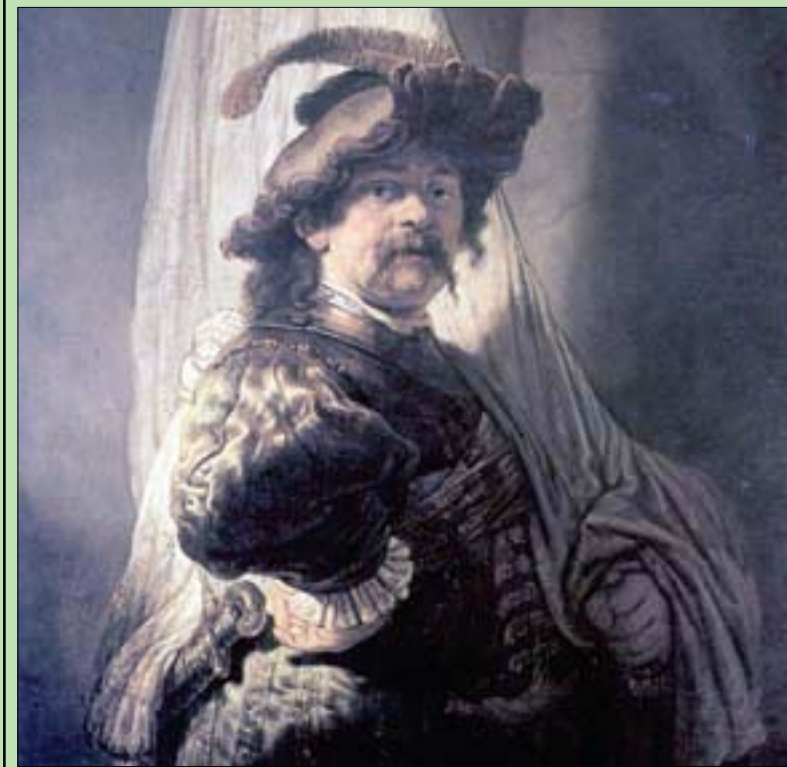
لوحة حامل الراية الملوكية لأفراد من عائلة روتشيلد رسمها رامبرانت عام 1636

تعرف باسم المعولات التعددية الموجبة (PAM)، ومن أمثلتها «الديازيبام» و«البرازولام» و«الكورديازيبوكسيد»، حيث وجدوا أنه باستخدام هذه المركبات، تم تعزيز نشاط المستقبلات، وهو ما زاد بشكل استثنائي من نشاط الخلايا العصبية الداخلية المثبطة. وتشير هذه النتائج التي تم نشرها أول من أمس في دورية «سيل ريبورتينغ»، أن استخدام مركبات (PAM) لتعزيز نشاط المستقبلات هو علاج فعال لمرض انقسام الشخصية. ويقول ماكسيميتز في تقرير نشره الموقع الإلكتروني لجامعة فاندربيلت بالتعاون مع نشر الدراسة «لأنقسام المرتبط بالمرض. ويعتقد أن الفصام يحدث عندما تصبح منطقة من الدماغ تسمى «قشرة الفص الجبهي» نشطة بشكل غير طبيعي؛ لأن الخلايا العصبية الداخلية، التي تربط الدوائر العصبية أو مجموعات الخلايا العصبية، تصبح غير فعالة وتتوقف عن تنظيم نشاط الخلايا العصبية. يسعى الفريق من جامعة فاندربيلت، برئاسة جيمس ماكسيميتز، إلى تعديل نشاط تلك الخلايا، ووجدوا مستقبلات الجلوتامات الموجهة نحو الأيض، والتي تعرف اختصاراً باسم (mGlu1)، هدفاً محتملاً لدواء يساعد في تحقيق ذلك، وهو ما تأكدوا منه عندما قاموا باختبار مركبات تساعد على تعزيز هذه المستقبلات،