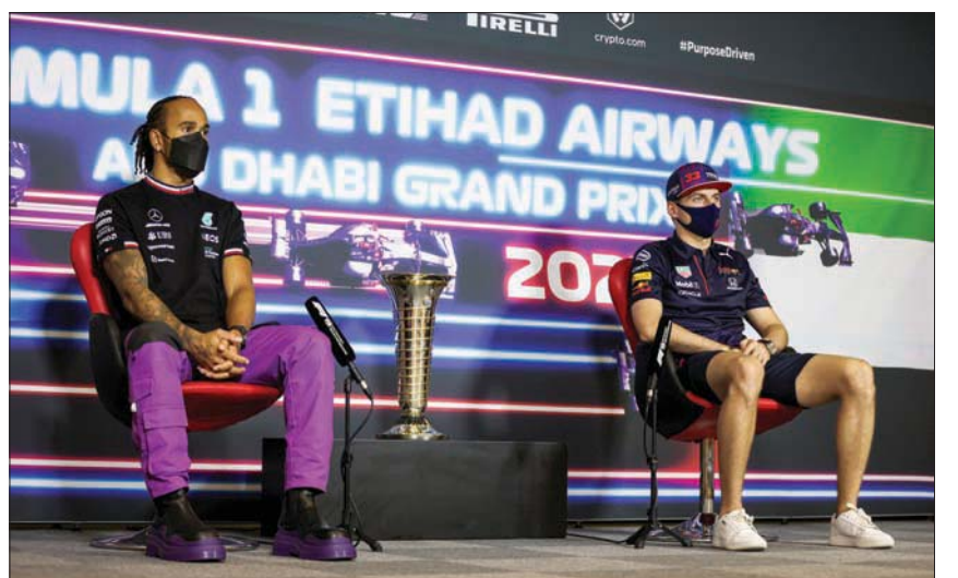
ماكس فرستابن ولويس هاميلتون خلال مؤتمر صحفي أمس

وستكون الحالة الوحيدة التي لن يخفي فيها هاميلتون التفوق على فرستابن في أن يحقق المركز التاسع ويأتي فرستابن عاشراً مع تحقيق