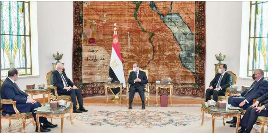
الرئيس المصري مستقبلاً رئيس الوزراء اللبناني أمس