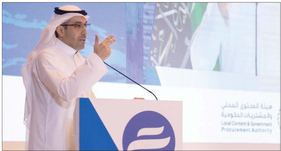
محافظ المؤسسة العامة لتحلية المياه المالحة متحدثاً خلال مؤتمر عقد أمس في الرياض

إلى ذلك، كشفت هيئة المحتوى المحلي والمشتريات الحكومية السعودية عن توقيع 4 اتفاقيات لتوطين صناعة منتجات الحماية الشخصية الطبية؛ وذلك تفعيلاً لأسلوب التعاقد على توطين الصناعة ونقل المعرفة المستحدث في نظام المنافسات والمشتريات الحكومية.