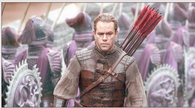
مات ديمون في «المبارزة الأخيرة»