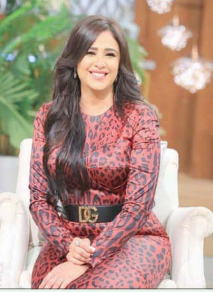
ياسمين عبد العزيز (برنامج معكم على فيسبوك)