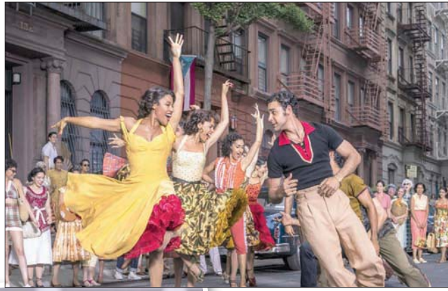
«وست سايد ستوري» نسخة 2021

الجديد أن نسخة سبيلبرغ الحالية تختلف في المنهج والأسلوب عن تلك الكلاسيكية. معظم النقاد الأميركيين بارك هذا الاختلاف على أساس أنه تحديث معاصر. في واقعها هو تحديث معاصر بالفعل لكن المشكلة هي أن الفيلم يبدو البأ في تنفيذه من دون التمتع بروح ذاتية.