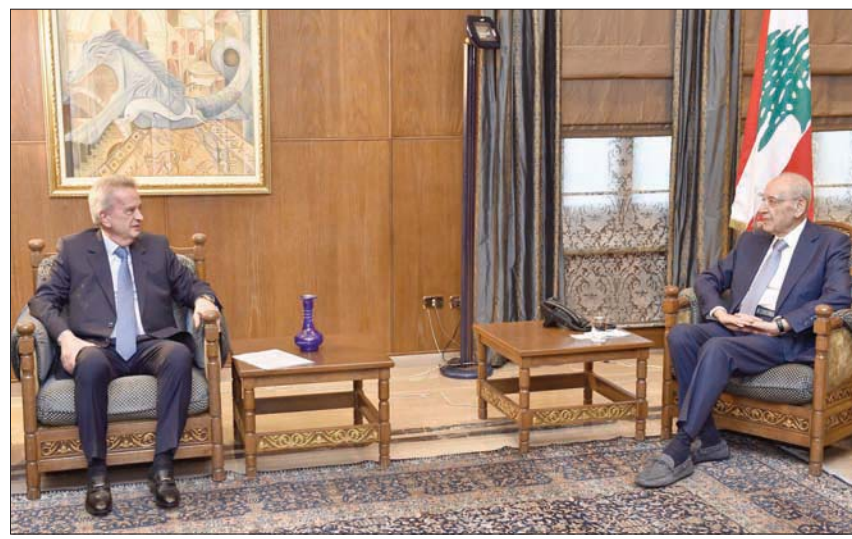
رئيس البرلمان نبيه بري مع حاكم مصرف لبنان أمس

دفع الضغط البرلماني وتراجع المودعين عن سحب ودائعهم من المصرف المركزي إلى رفع سقف السحوبات بالعملة الأجنبية إلى 3 آلاف دولار، ورفع قيمتها من 3900 ليرة إلى 8 آلاف ليرة للدولار الواحد، ما يعني تراجع «الهيكرات» على الودائع من 85% إلى 68%، وسط ضبابية تحيط بتنفيذ التعميم، وخاوف من تضخم إضافي يؤدي إلى رفع سعر الصرف في السوق السوداء، بما يتخطى ما سجله أمس وهو 25300 ليرة لبنانية للدولار الواحد.