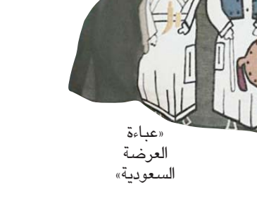
عباة العرصة السعودية

وهناك عباة العرصة السعودية التي تصفها التركي بـ«الجريئة» بالنظر لألوانها الصاخبة، وعباة القط العسيري المستوحاة من عرصة العرصة مع أعمدة الحديد ومعرفة ارتفاعها بدقة، وتفصيل أخرى قرأتها وساعتها على رسمها في قماش العباة. وتأتي الرواشين والمشربيات في قائمة القطع الأكثر طلباً، كما تؤكد التركي، والتي تعد من أبرز فنون العمارة الحجازية،