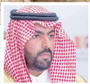
الأمير بدر بن عبد الله بن فرحان وزير الثقافة (واس)