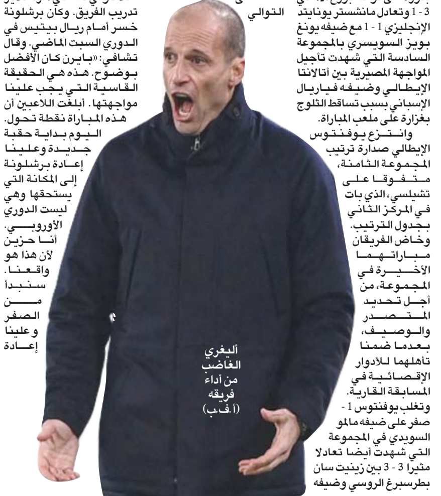
اليغري الغاضب من أداء فريقه