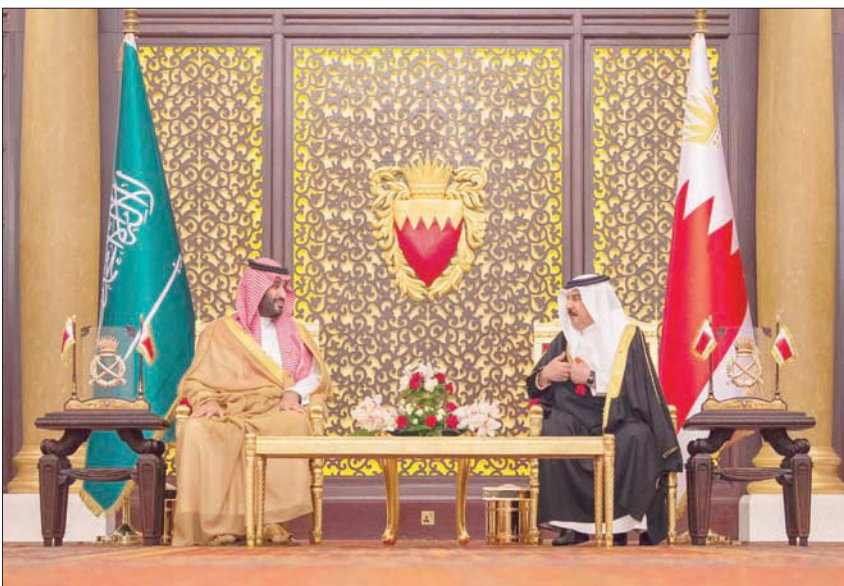
الملك حمد بن عيسى والأمير محمد بن سلمان خلال جلسة المباحثات التي عقدت في قصر الصخبر أمس

ويستعي ولي العهد في جولته الخليجية التي تسبق انعقاد قمة قادة دول مجلس التعاون في الرياض منتصف الشهر الحالي، إلى تعزيز العلاقات المتعددة الأقطار والمواقف تجاه القضايا الإقليمية والدولية، كما تؤكد زيارة ولي العهد للمنامة ودول مجلس التعاون الخليجي الموقف السعودي من أهمية المحافظة