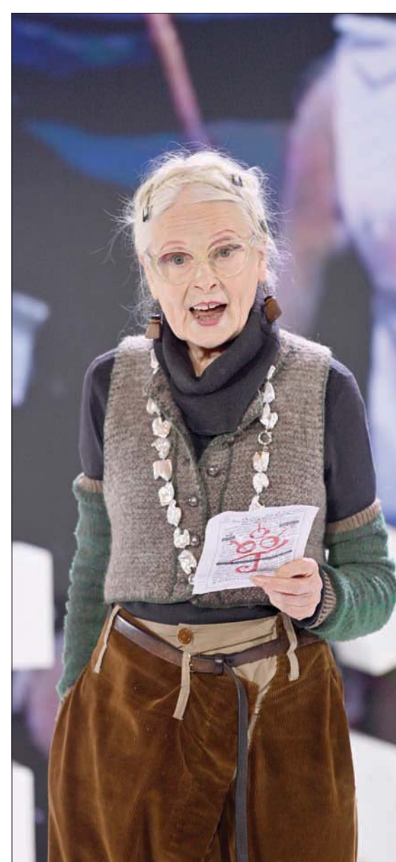
المصممة فيفيان ويستود تُلقي كلمتها في يوم الافتتاح

فالعالم الذي تطرقت فيه إلى مستقبل الموضة وحريتها الجديدة في وجه التطورات التي يفرضها العصر. اختتم عمران المؤتمر مساء يوم الجمعة بإلقاء تحية للمصمم الغيني الأصل، فيرجيل أبلو الذي غيبه الموت مؤخراً بعد صراع مع المرض الخبيث قاتلاً: «أخبرني أخدم أنه في التقاليد الغينية يجب الاحتفال بحيات الميت عوض البكاء عليه، ولهذا فنحن هنا نتحدث بفرجيل». وذكر أنه تواصل مع المصمم الراحل في شهر أكتوبر (تشرين الأول) الماضي، إذ كان من المفترض أن يكون حاضراً بيننا لكي يتلقى جائزة (فويسز) التي تقدم كل عام لشخصية استطاعت أن تستخدم تأثيرها بشكل إيجابي على العالم» لكن الموت كان سابقاً. بيد أن لم يمنح من منح فيرجيل أبلو الجائزة علناً فأباديه البيضاء على كل ما يتعلق بدعم المواهب الصاعدة، أو إعطاء صوت للمهمشين الذين لا صوت لهم، فضلاً عن نجاحه في خض تايوهات الموضة الكلاسيكية. بعد لحظة صمت، عاد عمران ليُذكرنا بأن الحياة تستمر وبأن الفكرة من المؤتمر أن نتحدث عن المستقبل. كما العادة، كانت هناك تصريحات هامة وقرارات واضحة واقتراحات للرؤساء التنفيذيين وأصحاب القرارات تستهدف جعل هذا المستقبل أكثر جمالاً وأملًا، سواء فيما أذخم بعين الاعتبار التغيير المناخي وتأثيره على المستقبل وحماية البيئة أو وسائل الخروج من أزمة «كوفيد 19» بأقل الخسائر. من التصريحات المهمة التي شهدتها المؤتمر إعلان مجلة «إيل» قرارها مقاطعة كل المنتجات المصنوعة من الفرو الطبيعي في كل مطبوعاتها، وعددها 45. وذلك بعدم تصويرها ومنحها أي مساحة في المجلة، لتكون أول مطبوعة عالمية تأخذ هذه الخطوة بشكل جذري وحاسم. في كلمة ألقاها