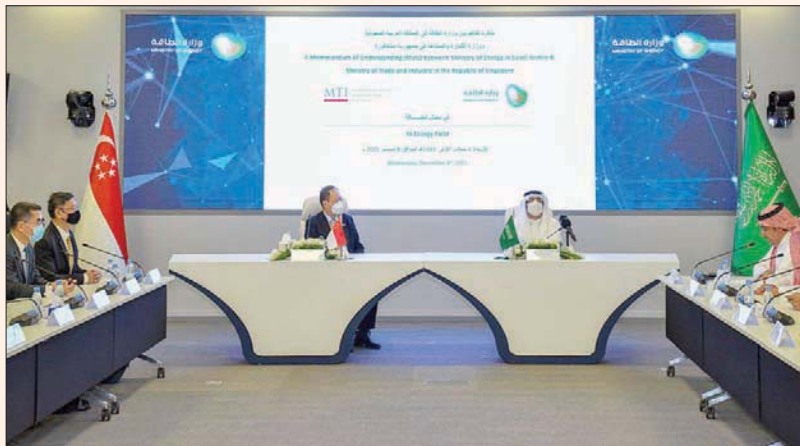
توقيع مذكرة تفاهم سعودية - سنغافورية لتعزيز توجهاً الطاقة النظيفة والحياد الكربوني

الرياض، الشرق الأوسط الاقتصاد الدائري للكربون إطاراً متكاملًا وشاملاً لمعالجة التحديات المترتبة على انبعاثات غازات الاحتباس الحراري وإدارتها عبر أربعة محاور تشمل (الخفض، وإعادة الاستخدام، والتدوير، والإزالة).