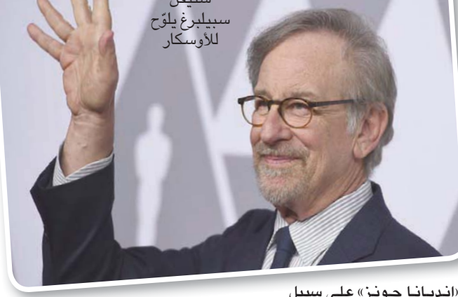
ستيفن سبيلبرغ يلوّح للأوسكار

هذا لا يعني أن الفيلم الجديد خال من الجهد في عمق عناصره (من الكتابة إلى الإخراج وتصميم المناظر والتوليف حتى لناحية التصوير) لكنه الجهد الذي يؤدي إلى فيلم غير الذي ورد في النسخة السابقة مع رقصاتها واستعراضاتها التي انتهتها الكاميرا