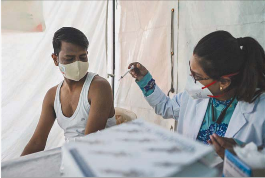
مركز تطعيم في نيودلهي بالهند

سيكوليلي موبو، أول عالم يكتشف سلالة أوميكرون من «كورونا» التي انتشرت سريعا في أنحاء العالم، إن السرعة التي بها النمط غير المعتاد لتحوّراتها يبعث على القلق، حسبما أفادت وكالة بلومبرغ للأنباء. وتثير سرعة التحوّرات أيضا تساؤلات بصدد كيفية تحور السلالة وتزيد الارتباك بشأن معدل انتقال العدوى بالسلالة الجديدة، وذكر موبو، مدير مختبر فيروس نقص المناعة المكتسب في معهد