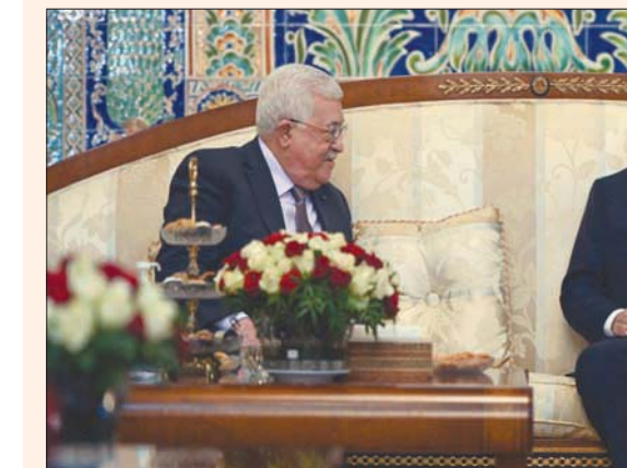
تبون وعباس خلال اجتماعهما في العاصمة الجزائرية

«الحديث عن التحديات الأمنية الجديدة التي تواجه الجزائر، بعد أن باتت إسرائيل على حدودها»، حسب وصف هذه المصادر.