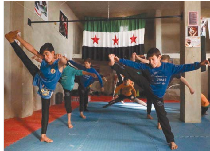
أطفال يتعلمون رياضة الكونغ فو وخلفهم علم الثورة السورية