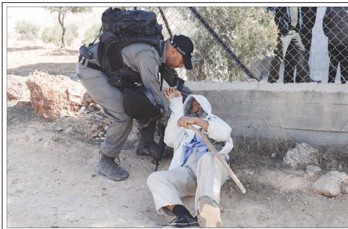
جندي إسرائيلي يعتدي على مسن فلسطيني وأجه قوات الاحتلال أثناء هدمها بيتاً في مسافر يطا جنوب الخليل

وقال أهرون تسوهر، الذي يسكن في النقب وحضر إلى المظاهرة وهو يحمل بندقية إم 16، إنه جاء للمشاركة بعدما سمع أن العرب لا يحجون رؤية علم إسرائيل يرفرف فوق المدينة. وأضاف: «نحن انتظرنا 2000 سنة حتى تعود إلى أرض إسرائيل. ولن