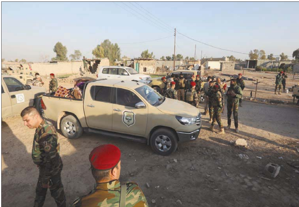
بغداد: فاضل التمشي

في حين توعد الناطق باسم القائد العام للقوات المسلحة اللواء يحيى رسول، أمس (الاثنين)، في الضرب «بيد من حديد الجديدي» التي جلبت لهم هذه المقاعد، بينما لو كانوا أحسنوا التعامل معه لكانوا حصلوا على أكثر من 70 مقعداً، وكانوا هم مفاجأة الانتخابات الكبرى. ويعتد عن لقاء الحنانة المفترض اليوم، أو مصادقة المحكمة الاتحادية من عدمها، فإن الغفاهات داخل الغرف المغلقة تجري بين الجميع مرة بصورة مباشرة، وأخرى بصورة غير مباشرة، بشأن الية تشكيل الحكومة المقبلة. وأصل الغفاهات الجارية بين كل الأطراف هو حول شكل الحكومة القادمة؛ هل هي حكومة أغلبية وطنية أم حكومة توافقية. وبين من يريد الأغلبية (الصدر) حتى الآن فقط، ومن يريد التوافقية (كل القوى الأخرى بمن فيهم الكرد والسنة)، يجري الحديث عن إمكانية أن تشكل الحكومة طبقاً لقاعدة جديدة هي «التوافقية الجزئية». وفي هذا السياق يقول الباحث فرهاد علاء الدين، رئيس المجلس الاستشاري العراقي، لـ «الشرق الأوسط»، إن المقصود بحكومة التوافقية الجزئية هي التي لا تشارك فيها قوى تكون بالمعارضة، وهي من كل الأطراف العراقية»، مضيفاً أن «الحكومة التوافقية التي يجري الحديث عنها الآن لن يشارك فيها الكرد كلهم مثل حزب الجبل الجديد والأحزاب الإسلامية الكردية التي خارج تشكيلتها وخارج المعادلة». وأوضح أن «السنة كذلك لن يشاركوا كلهم سواء عن طريق الاختيار أو إبعاد بعضهم».