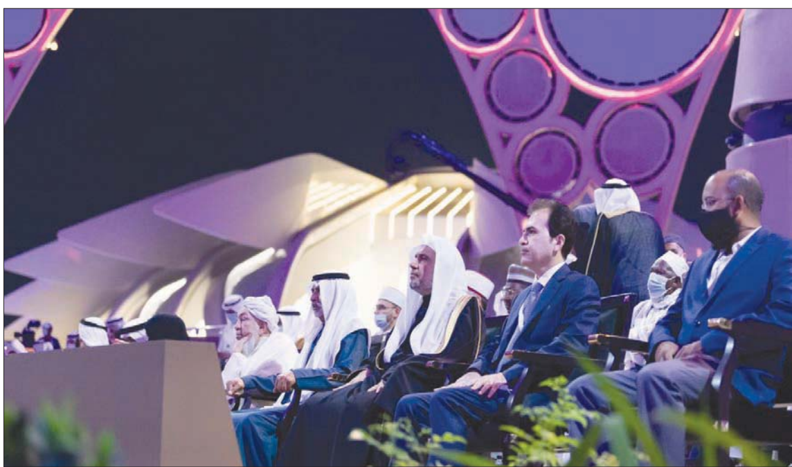
الشيخ نهيان بن مبارك وزير التسامح الإماراتي والشيخ الدكتور محمد العيسى أمين رابطة العالم الإسلامي خلال الجلسة التي احت

عودة للعنصرية بجاهليتها المقبته، ليس في دول متاخرة مادياً أو في دول تسمى النامية، بل في دول ترقي بحسب تصنيفها السائد إلى العالم الأول، وعندما تحدث عن سبب هذا التخلف الحضاري الذي لم يلحق بالتقدم المادي المذهل، تجده غالباً في شيء واحد، وهو حلقة مفقودة في التعليم، حيث تم تسخير