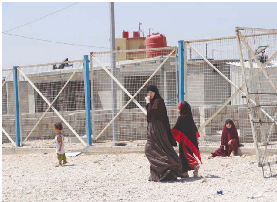
شهد مخيم «روج» بريف الحسكة حريقين خلال أسبوع واحد الشهر الماضي