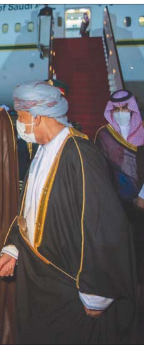
ولي العهد السعودي يصافح عدداً من المسؤولين العمانيين لدى وصوله إلى مسقط أمس (واس)

مشاركة الخبرات والتقنيات في مشاريع مشتركة، مثل إنشاء «أكوابور» السعودية، التي تعد من أبرز الشركات السعودية المستثمرة في السوق العمانية، مع شركة نفط عُمان، وشركة «Air Products»، لتنفيذ مشروعات في المنطقة الحرة بصلالة (SFZ)، تتعلق بإنتاج الهيدروجين الأخضر في السلطنة، وتقدر تكلفتها بـ 7 مليارات دولار، وإنتاج «الأمونيا الخضراء» بموسقط إنتاج قدره 1,003 مليون طن سنوياً.