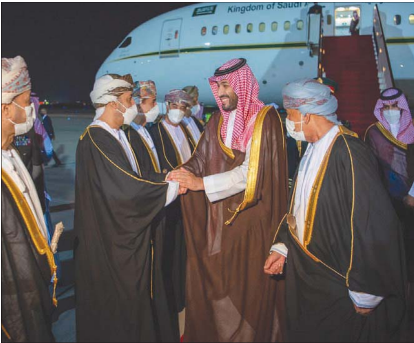
ولي العهد السعودي يصافح عدداً من المسؤولين العمانيين لدى وصوله إلى مسقط أمس (واس)

وفي سياق متصل، عد السفير عبد الله العنزي سفير السعودية في مسقط زيارة الأمير محمد بن سلمان إلى سلطنة عُمان تأكيداً للروابط