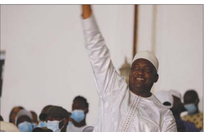
رئيس غامبيا الحالي أداما بارو يفوز بأغلبية ساحقة في الاستحقاق الرئاسي

وغامبيا إحدى نقاط الانطلاق الرئيسية للمهاجرين الساعين للوصول إلى أوروبا على متن زوارق. ويعاني الغامبيون ارتفاع أسعار المواد الأساسية مثل الأرز والسكر والزيوت وانقطاع المياه والتاثير الكهربائي وصعوبة الحصول على رعاية صحية.