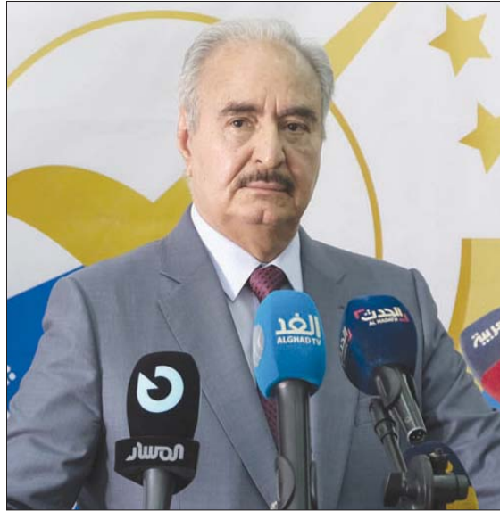
حفر بعد تقديم أوراق ترشحه في بنغازي يوم 16 نوفمبر