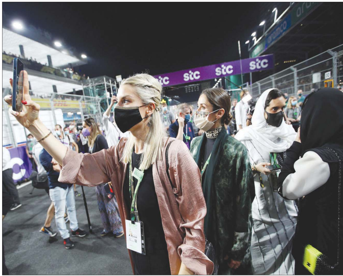
سباق «جائزة السعودية الكبرى لفورمولا 1» شهد حضوراً جماهيرياً كبيراً لمتابعة ورصد الحدث العالمي