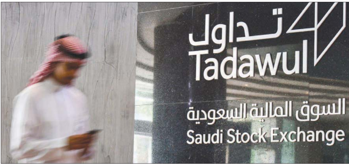
«تداول السعودية» تتأهب للإدراج غداً الأربعاء بعد طلب مضاعف للاكتتاب في أسهمها (الشرق الأوسط)

إلى ذلك، سجل المؤشر العام لسوق الأسهم الرئيسية السعودي أمس، انخفاضاً كبيراً عند تراجعته بنسبة 1,1 في المائة، حيث أغلق عند 11021 نقطة، تمثل خسارة 121 نقطة، وبتداولات بلغت قيمتها الإجمالية نحو 8,6 مليار ريال (2,2 مليار دولار).