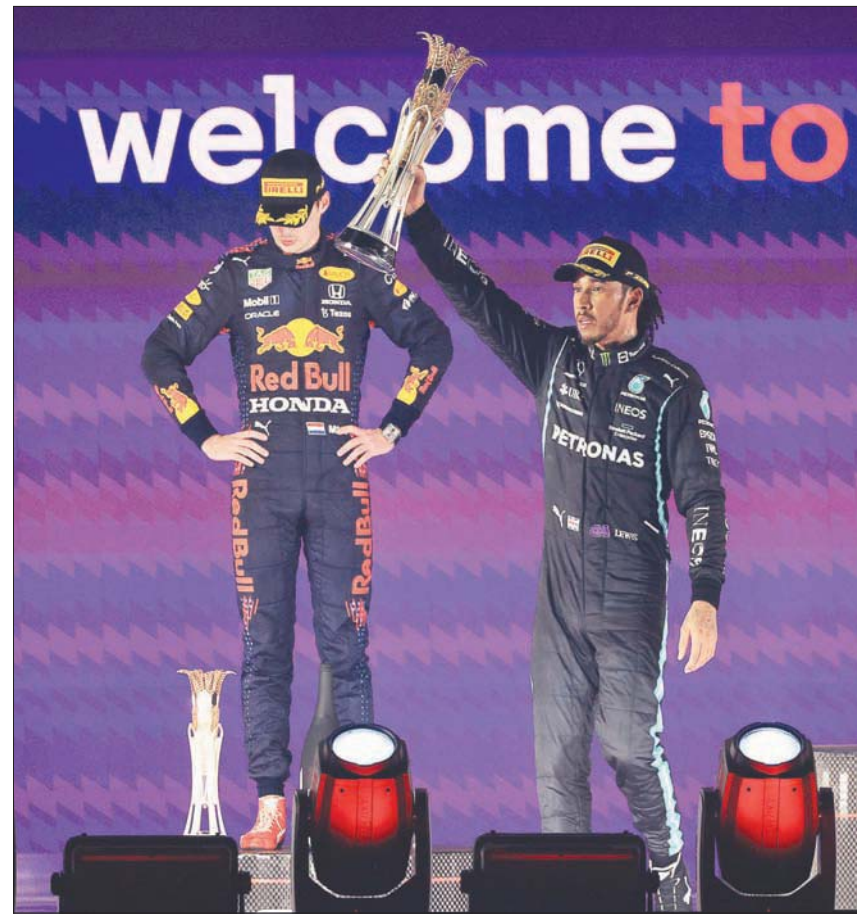
البريطاني هاميلتون يحتفل بفوزه في سباق «جائزة السعودية الكبرى لفورمولا 1» وسط حسرة منافسه الهولندي فيرستابن