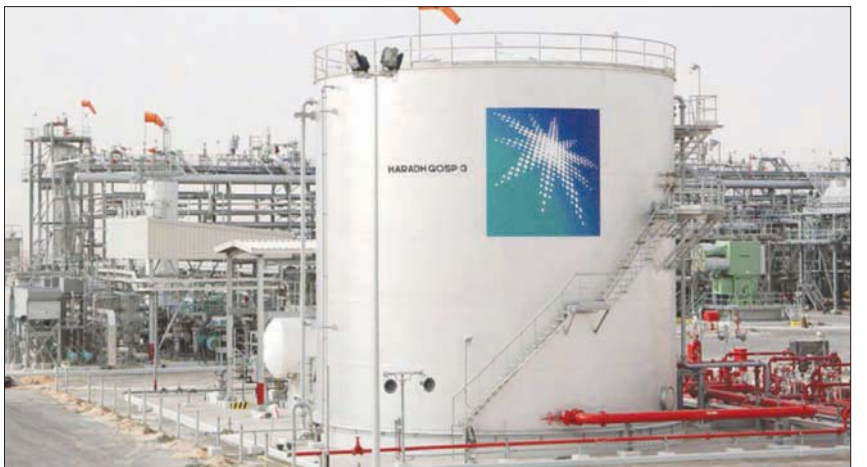
ينتظر المتعاملون إعلان السعودية أسعار خامها لاتفتاء الأثر خلال الشهر التالي

بهدف إحياء الاتفاق النووي لعام 2015. في الأثناء، ينطلق هذا الأسبوع مؤتمر مجلس الجيول العالمي، وقد تقلصت بشكل حاد قائمة الحضور من المسؤولين التنفيذيين بقطاع الطاقة والوزراء، مناقشة مستقبل سوق النفط، في الوقت الذي أربك فيه انتشار سلالة «أوميكرون» الجديدة من فيروس كورونا حركت أسعار النفط. ويجمع المؤتمر الذي يُعقد على مدى أربعة أيام، والذي تأجل من العام 2020 بسبب الجائحة، الشخصيات الرئيسية بالقطاع كل ثلاث سنوات، وكان من المتوقع أن يحضر مسؤولون من دول، منها السعودية، ونيجيريا، والهند، والولايات