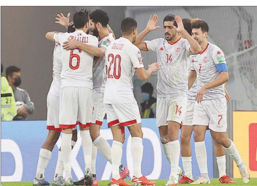
لاعبو المنتخب التونسي يحتفلون بهدف زميلهم الجزائري في شبك الإمارات أمس

المجموعة بفارق الأهداف عن سوريا. إلى ذلك، يواجه المنتخب السعودي اليوم نظيره المغربي ضمن منافسات الجولة الثالثة والأخيرة من دور المجموعات لبطولة كأس العرب والمقامة في قطر، بحثاً عن فوز يعزز من فرصه بلوغ دور ربع نهائي البطولة في حين يلقي الأردن وفلسطين في مواجهة يتطلع خلالها المنتخبان للفوز لتعزيز حظوظهما كذلك بلوغ الدور القادم. ويحتل المنتخب المغربي صدارة المجموعة الثالثة بـ 6 نقاط، بفارق الأهداف عن الأردن الذي