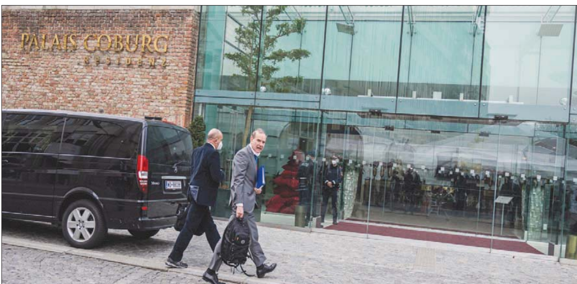
إيراني موراً منسق الاتحاد الأوروبي لدى وصوله إلى قصر كوربوغ للمشاركة في محادثات فيينا الأسبوع الماضي

في الجولات السابقة «المطالبة بالمزيد». وحذر: «لا يمكن أن نغفل بوضع، تسرع فيه إيران وتيرة برنامجها النووي، مع الماطلة في دبلوماسيتها النووية».