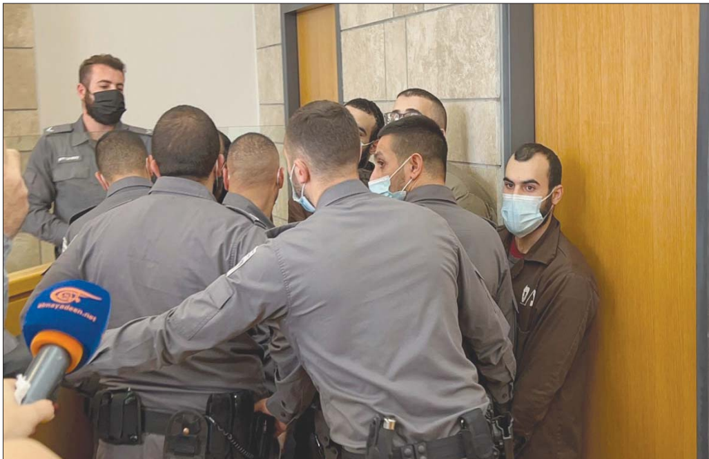
حراس إسرائيليون يطوقون أحد الأسرى بالمحكمة أمس

وتمكن الأسرى من قول بعض الكلمات للصحافة أكدوا فيها أن «مصلحة السجون تدير سياسة انتقام بشع» منهم. وبالإضافة إلى العزل والانعطاع التام عن العالم الخارجي، توجد لديهم «مشكلة مع الطعام القليل والسيء ومع العلاج الطبي الذي يبدو مفقوداً ومن معاملة مهينة وتكثيف متواصل وعنف مستمر».