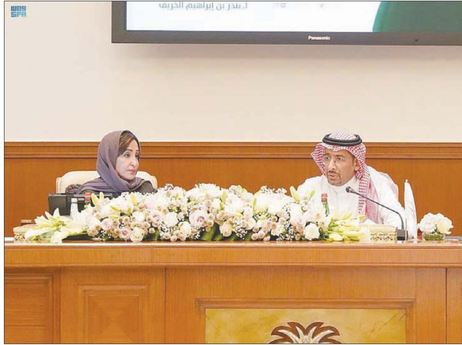
وزير الصناعة والثروة المعدنية السعودي متحدثاً في ندوة نظمها جمعية الاقتصاد السعودي أخيراً (الشرق الأوسط)

تتجه السعودية نحو تنفيذ خطة وطنية من أجل توطين صناعة الأدوية واللقاحات بعضوية العديد من الجهات، في مقدمتها وزارة الصحة والهيئة العامة للغذاء والدواء؛ إذ وفقاً لوزير الصناعة والثروة المعدنية السعودي بندر الخريف، تقود وزارته خطة لإعطاء أولوية لتوطين القطاع العلاجي لأهميته في تحقيق الأمن الدوائي والصحي.