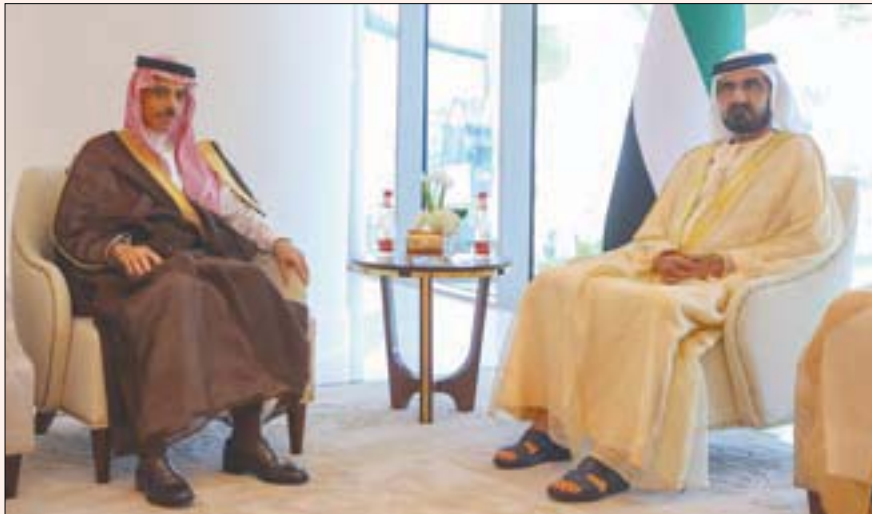
الشيخ محمد بن راشد آل مكتوم نائب رئيس الإمارات مستقبلاً وزير الخارجية السعودي