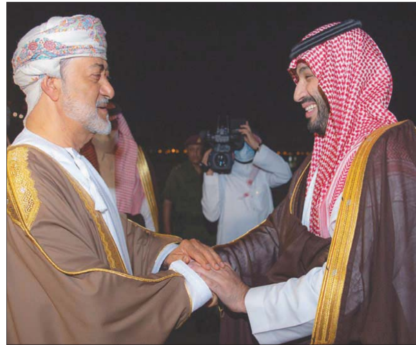
السلطان هيثم مستقبلاً الأمير محمد بن سلمان لدى وصوله إلى المطار السلطاني الخاص في مسقط أمس (واس)

مشاركة الخبرات والتقنيات في مشاريع مشتركة، مثل إنشاء «أكوابور» السعودية، التي تعد من أبرز الشركات السعودية المستثمرة في السوق العمانية، مع شركة نفط عُمان، وشركة «Air Products»، لتنفيذ مشروعات في المنطقة الحرة بصلالة (SFZ)، تتعلق بإنتاج الهيدروجين الأخضر في السلطنة، وتقدر تكلفتها بـ 7 مليارات دولار، وإنتاج «الأمونيا الخضراء» بموسقط إنتاج قدره 1,003 مليون طن سنوياً.