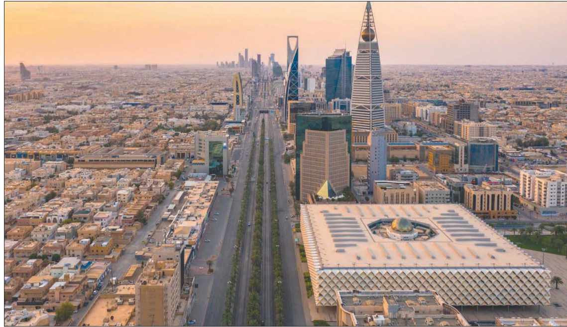
الرياض تتأهب لاستضافة القمة الخليجية منتصف الشهر الجاري

التعاون الاقتصادي والاستثماري، خاصة ما يتعلق بتأسيس المشروعات الاستراتيجية بين السعودية ودول الخليج، إلى جانب ذلك ضرورة استفادة القطاع الخاص الخليجي مع خلال اتحاد الغرف السعودية مع كل غرفة من الدول الأعضاء في تنظيم اجتماعات مجلس الأعمال المشتركة لتوصّل خلالها إلى إقامة المشروعات المشتركة التي يستفيد منها المواطن الخليجي وتقوم على الاستفادة من البنية التحتية. ويرى دقي أن القطاع الخاص الخليجي أمامه فرصة ذهبية لاستفادة من هذه الجولة قدر الإمكان، مؤكداً أنها تعكس أهداف وطموحات قادة المجلس وتظهر الإيمان بأهمية توطين الاستثمار الخليجي. وتوقع نقي أن تنجح الجولة الحالية عن جهود تكون مرتكزا أساسيا للقمة المقبلة لمجلس التعاون لدول الخليج العربية التي سيكون أهم مخرجاتها ما يتحقق من هذه الزيارات، مفضها أن مجلس الأعمال السعودي