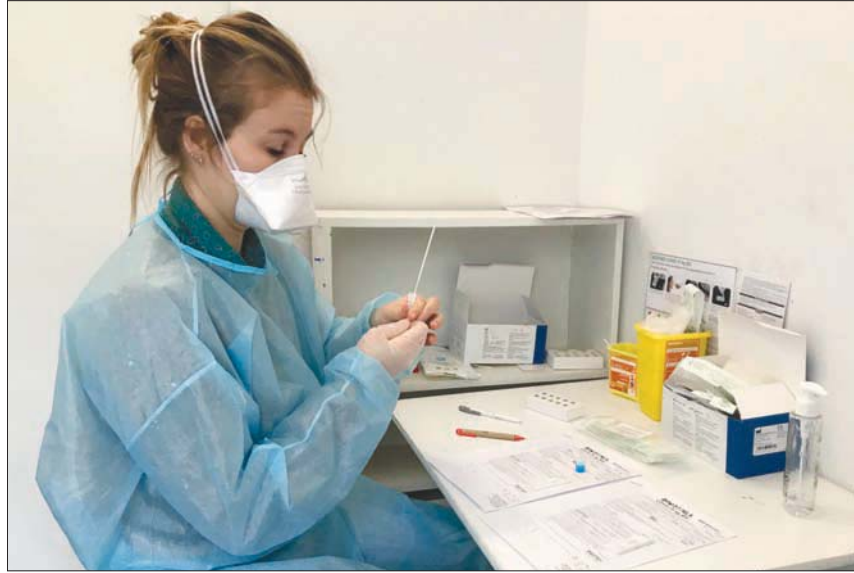
مختبر فحص «كورونا» في فرنسا

ويقول خبراء الصحة إن الجهود المبذولة لإنهاء جائحة (كوفيد - 19) كانت متفاوتة ومتفرقة واتسمت بقدرة محدودة على الحصول على اللقاحات في الدول ذات الدخل المنخفضة، في الوقت الذي يحصل فيه الأوصياء الأثرياء في الدول الغنية على جرعات إضافية مكثفة. وقالت جيلبرت إن الزوائد البروتينية التي يحتوي عليها