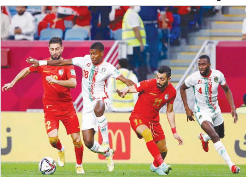
جانب من مواجهة منتخبي موريتانيا وسوريا في الجولة الأخيرة لدور المجموعات أمس