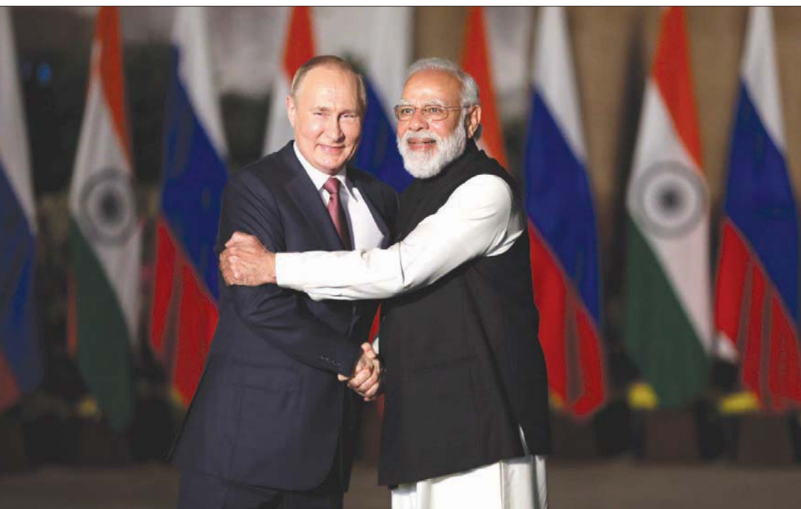
على بوتين يتعامل مع توازنات إقليمية معقدة في ظل ارتفاع مستوى التوتر بين نيودلهي وبكين الحليف التقليدي لموسكو