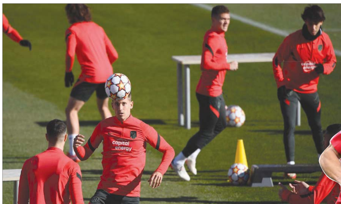
لاعب أتلتيكو خلال التدريبات قبل المواجهة المصرية ضد بورتو

وفي المجموعة الرابعة، ستحكون مواجهة ريال مدريد الإسباني (12 نقطة) مع إنتر الإيطالي (10) اليوم من أجل حسم الصدارة، فيما يلعب تيراسبول المولداني (6 نقاط) والذي ضمن إكمال المشوار في الدوري الأوروبي، ضيفاً على شاختر دونيتسك الأوكراني الأخير بنقطة واحدة.