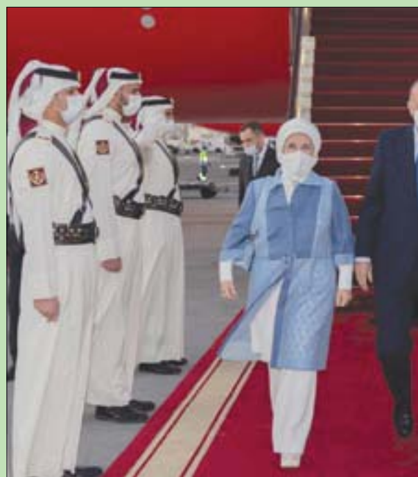
الرئيس التركي رجب طيب أردوغان لدى وصوله إلى مطار الدوحة الدولي أمس (قنا)

وأكد أن «هذه المشكلة مؤقتة ونحن نتخذ التدابير اللازمة وأن خبراء في تركيا يعكفون على حل هذه المشكلة»، مشدداً على أن الاقتصاد التركي واعد السوق التركية واعدة والتكثيف من الدول تريد الاستثمار في تركيا. وقال وزير الخارجية القطري إن العلاقات بين قطر وتركيا استثنائية وتتمتع بشراكة كاملة مشيراً إلى أنه ناقش مع نظيره التركي التطورات العربية، وهذا كان موقفاً ونحن باقون عليه»، وتابع: «نحن نأمل أن نرى دور الدول العربية أن هذه الأسباب لا تزال موجودة».