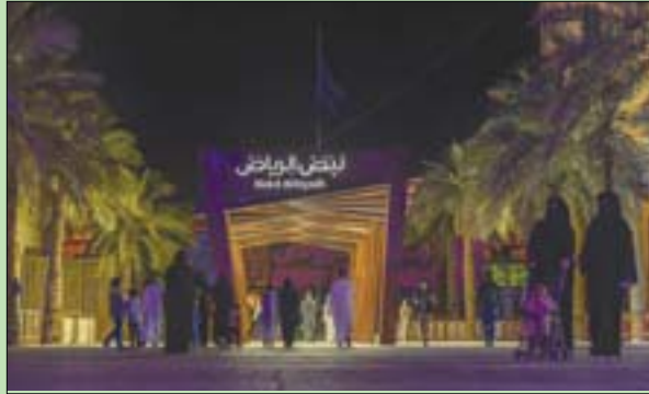
تعد نبض الرياض إحدى المناطق المجانية في الموسم

أكثر من 100 عام، منذ استعادة الملك عبد العزيز آل سعود لمدينة الرياض، وصولاً إلى تقدم البلاد، وتضاعف تأثيرها وقوتها على المستويات الإقليمية والعالمية. وشكلت جداريات «نبض الرياض» نقطة جذب للزوار من خلال عروض ثلاثية الأبعاد تؤكد أصالة المناطق وعراقتها التراثية، كما ظهرت من خلال فعاليات المناطق، مواهب إبداعية سعودية في العروض الموسيقية من خلال تجربة العزف على الآلات الموسيقية الحية بطرق فنية متنوعة.