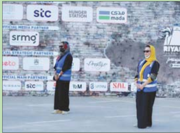
سعوديات يستثمرن الفرص التنظيمية سعياً لإنجاح موسم الرياض

ويبدو هذا «التشتت المدني» الذي نعيشه، هو ما يدفع أحياناً المحاضرين المحترفين إلى التخلي عن «تأجيل فقرة الأسئلة إلى النهاية»، بالإفصاح في المجال، لأي سؤال أثناء الحاضرة، أملاً ببت روح التفاعل ودرعاً للملل. والواضح أن الانتباه يعتمد على أمور عدة؛ منها مدى اهتمامنا بالمادة، ومدى أخذنا قسطاً كافياً من النوم، ومدى سلاسة طرح المتحدث وحتى الكاتب؛ غير أن الحفاظ على انتباه الناس في عصر الترشيق المعلوماتي، لم يعد أمر يسيراً، وهو ما يبدو أن تلك المؤسسات قد أدركته جيداً... فخير الكلام ما قل ودل.