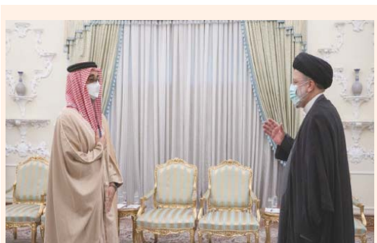
رئيسي مرجباً بطحنون بن زايد في طهران أمس