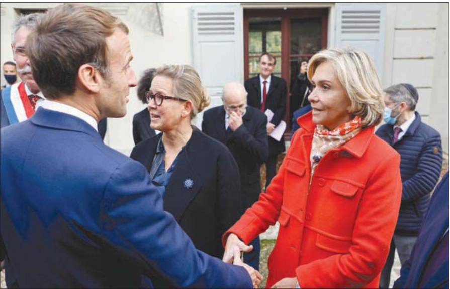
ماكرون يرحب بمرشحة حزب «الجمهوريون» اليميني فاليري بيكريس

القديمه من خلال إنشاء دفاع أوروبي قادر على حماية المصالح الأوروبية والتدخل في الجوار القريب، إضافة إلى إعادة النظر في اتفاقية «شنغن» لجهة جعلها أكثر تشدداً في موضوع الهجرات غير الشرعية. والرئيس الفرنسي عازم على الدعوة إلى عقد قمة أوروبية في مارس (آذار) المقبل تخصص للملف الدفاعي بعدما حصل من الرئيس جو بايدن على موقف أميركي متساهل بشأن قيام دفاع أوروبي يكون ردفاً لـ«الحلف الأطلسي» وليس بديلاً عنه. والرأي السائد أن ماكرون سوف يستخدم رئاسة الاتحاد لإظهار موقعه الاستثنائي بوصفه الأكثر قدرة على قيادة الدورة الأوروبية بعد خروج المستشار الألمانية من المسرح السياسي الأوروبي وغياب «مناقش» له ربما باستثناء رئيس الوزراء الإيطالي ماريو دراغي الذي أعاد إيطاليا إلى أسطة المسرح الأوروبي.