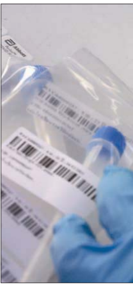
مختبر في بانكوك يفحص الأجسام المضادة لفيروس «كورونا»

نفس الخلية المضيفة أثناء عمل نسخ من نفسها، ما ينتج عنه نسخ جديدة تحتوي على بعض المواد الجينية من كلا الفيروسين. ويقول ساوندراجان وزملاؤه في الدراسة، التي لم تخضع بعد لمراجعة الأقران، إن «هذه