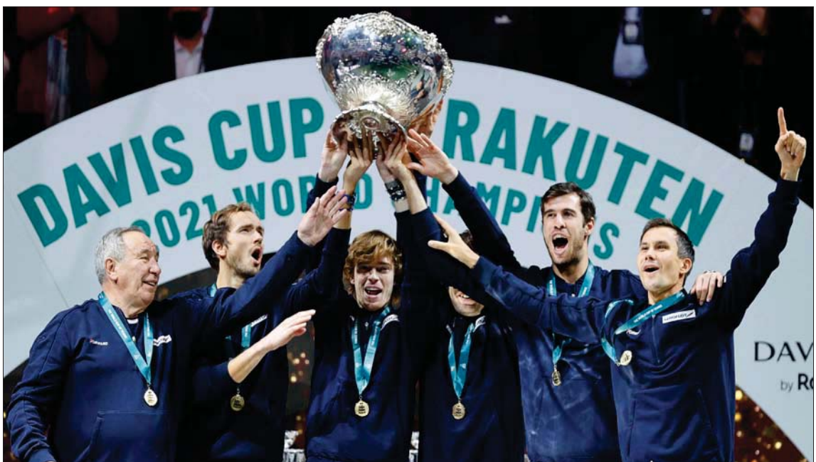
المنتخب الروسي يحتفل بالتتويج بطلاً لكأس ديفيس للتنس

ديوكوفيتش المصنف أول عالمياً الذي خرج مع منتخب بلاده من الدور نصف النهائي هذا العام، أنه من الضروري تغيير الصيغة، التي طرحت مشاكل خاصة من خلال إقامتها على مدار العام في جدول مليء بالدورات والبطولات الكبرى. وبالغف سيتم تغيير هذا النظام، كما سينخفض عدد المنتخبات المشاركة في المرحلة النهائية من 18 إلى 16 فريقاً للتنج الحسابات المعقدة لتحديد