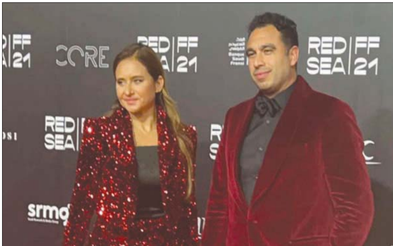
الفنانة نيللي كريم وزوجها