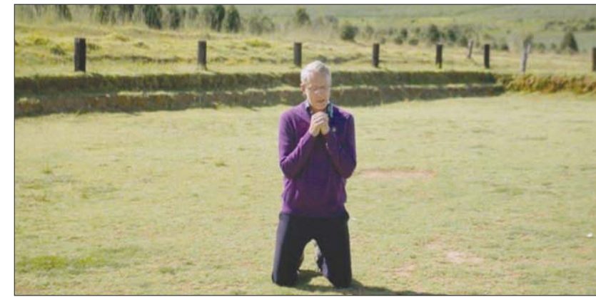
من الفيلم الفائز بذهبية القاهرة «ثقب في السياج»

بدأ بتصوير حافلة من التلامذة الصغار تصل إلى منطقة محاطة بسياج على التلاميذ البقاء داخله. هي رحلة استجمام وصلوات دينية وأنصباغ لأوامر المرشدين والمعلمين التي تبدأ بالتحذير من هذا الموقع أو التعامل مع أي من السكان. وهذا التحذير يأتي مصحوباً بعبارة... «وتذكروا أنكم مُراقبون»، لا يكمل الخطيب العبارة ليشير من يراقب من، لكنه يفصح عن أن الرقيب الأول هم المجموعة التي قادت هؤلاء التلاميذ إلى المكان المسج. ما يعنيه هؤلاء الفتيان طوال الوقت هو أقسى الممارسات الممنوعة لمن هم فوق، في القيادة، قد تذكر بعض المشاهد بالنصف الأول من رائعة ستانلي كوبريك Full Metal Jacket سنة 1987. هناك شاهدنا ذلك المجدّ الشاب (فنست داونوفريو) يتلقى تكتيلاً لفظياً وجسدياً من قبل العريف (.