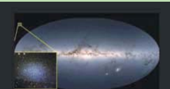
مجرة «الأسد الصغير» تحتوي على ثقب أسود هائل في مركزها

كمية المادة المظلمة في المجرة باستخدام أداة (Virus - W) الموجودة في تلسكوب «هارلان» التابع لجامعة تكساس الذي يبلغ طوله 2,7 متر. وتقيس الأداة (Virus - W) حركة النجوم في المجرات الصغيرة حول مجرة درب التبانة وتستنتج كمية المادة المظلمة في تلك المجرات من تلك الحركة. والمادة المظلمة هي المادة الغامضة غير المرئية التي تتصدى لقوة الجاذبية، ويمكن للعلماء قياس تركيزاتها في الكون بناءً على تأثيرها على مدارات وسرعات النجوم القريبة، وكلما زادت المادة المظلمة في مدار النجم، زادت سرعة انتقالها. وعندما شغل الفريق البيانات التي جُمعت في الملاحظات من خلال نماذج الكمبيوتر الخاصة بهم، وجدوا أن مجرة «الأسد الصغير»، على ما يبدو أنه ليس لديها مادة مظلمة بشكل أساسي، ولكن ثقباً أسود في مركزها يبلغ ثقل 3 ملايين شمس، وهذا كان مفاجأة للباحثين لأن الثقب الأسود (Sagittarius A) في مركز مجرة درب التبانة أكبر بنسبة 25 في المائة فقط.