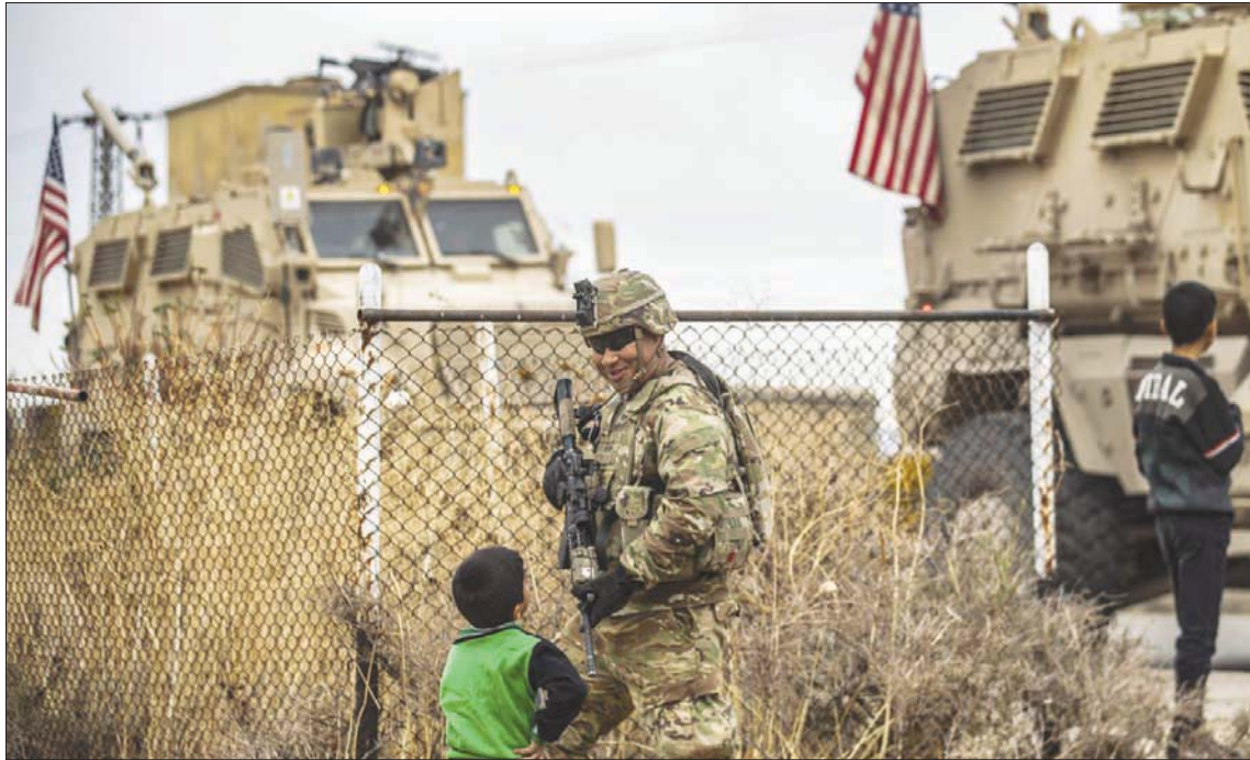
جندي أميركي خلال دورية في ريف المملكية بمحافظة الحسكة شمال شرقي سوريا أول من أمس (أ.ف.ب)

سوريا. وذكر أن الدورية المؤلفة من 8 عربات عسكرية روسية وتركية، انطلقت برفقة مروحيتين روسيتين من قرية أشمة الواقعة غرب كوباني، وجاءت قري جارقلي فوقاني، وقران، وديكماش، وخورخوري، وبوبان، وصولاً إلى تل شعير. وعادت الدورية بعدها إلى نقطة الانطلاق في قرية أشمة، مروراً بقرى سوسان، وقولا، وقره قوي، وبيندر، ومشكو، وجبنة، وجارقلي فوقاني. وبما عادت العربات العسكرية التركية أدرجها من الجوابية القريبة من قرية أشمة، رجعت العربات العسكرية الروسية إلى مركزها قرب بلدة صرين جنوب كوباني.