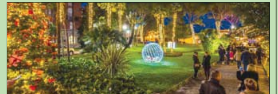
بلدة أوباتيا الساحلية في كرواتيا تتزين لاستقبال السياح في الشتاء

والى جانب العرض الخاص بعيد الميلاد، تُعرف المقاصد السياحية الكرواتية مثل هذه أيضاً بمجموعة واسعة من أساليب الطهي التي تمزج شوارعها وميادينها، وتقدم حلبة تزلج على الجليد، وتنظم فعاليات خارجية مختلفة للزوار في المنتجع الساحلي.