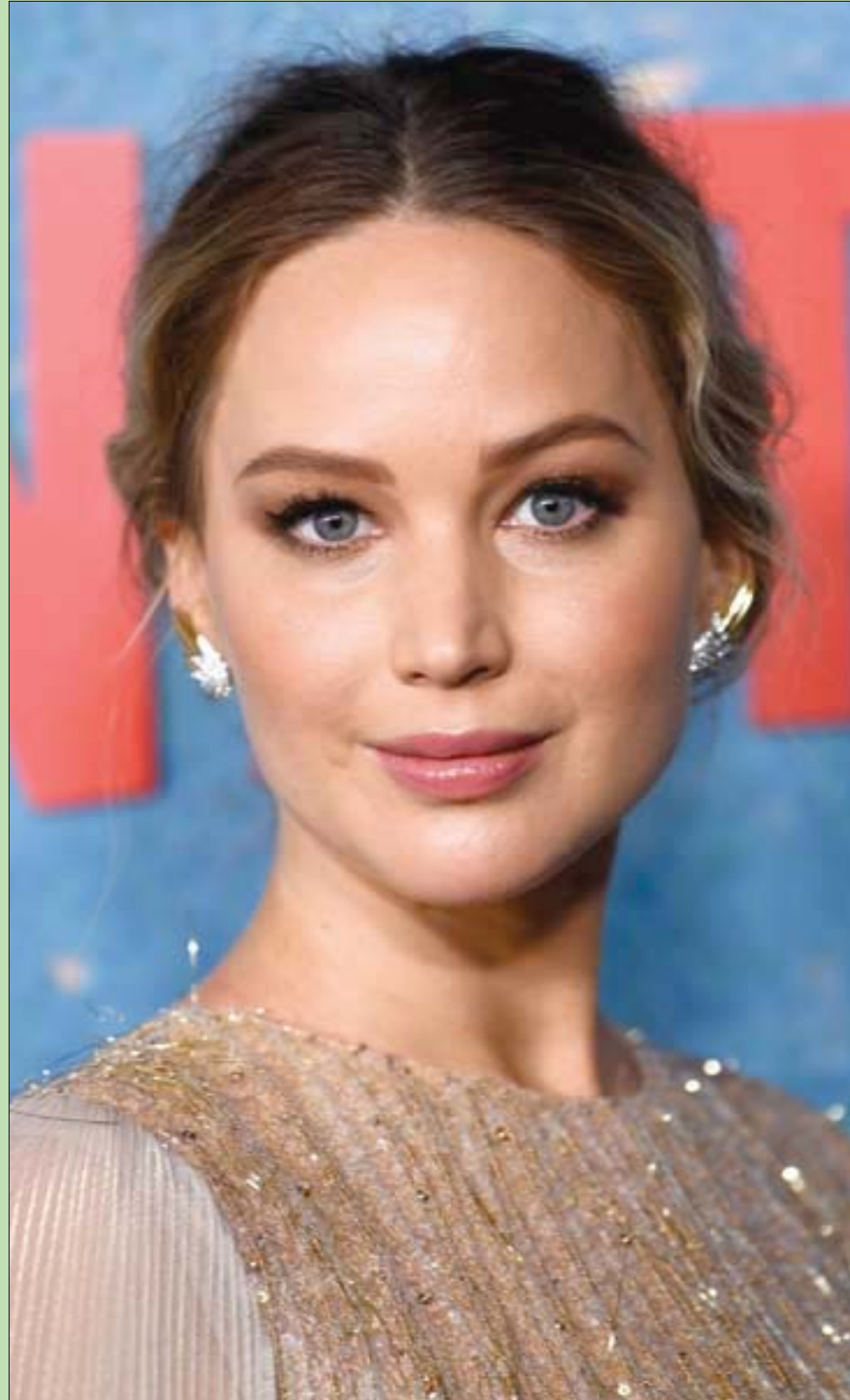
جينيفر لورانس لدى حضورها العرض العالمي الأول لفيلم «لا تنظر إلى الأعلى» في مركز لينكولن بنيويورك

أكثر من أساءوا السمعة للإسلام هم المتعصبون المتطرفون، الذين أشعلوا النار بالهشيم، وتوالدت من خطبهم وكتاباتهم وتحريضاتهم: «الفاقة» و«داعش» و«وعير وصورير والي ما فيه خير».