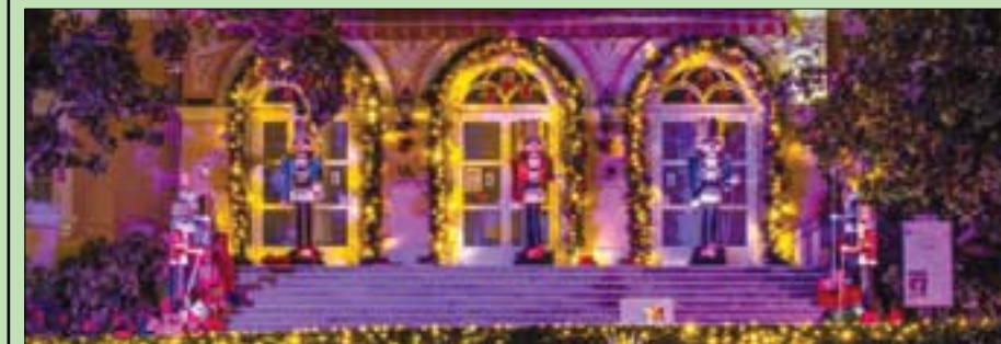
البلدة التاريخية ساحرة بما يكفي كما هي بغيلاتها وحدثاتها الكثيرة (موقع أوباتيا أونلاين)