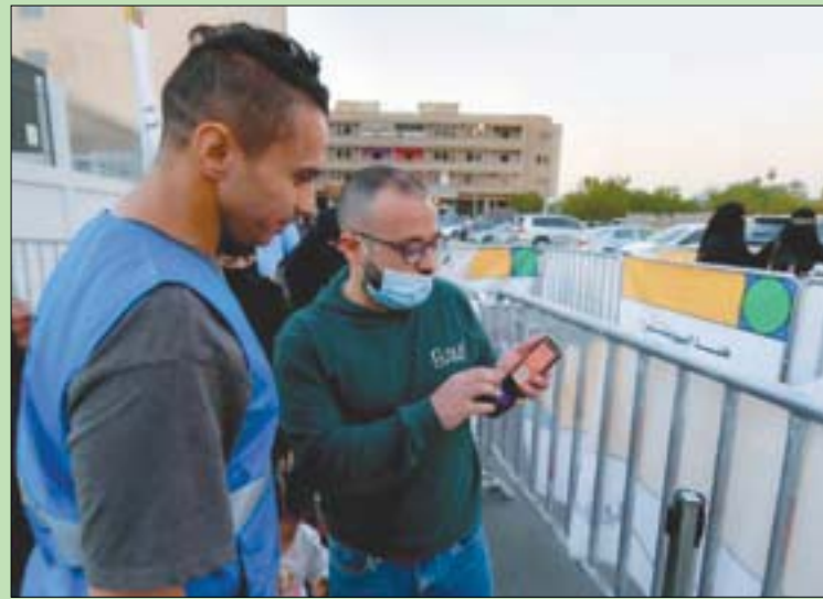
تنظيم الموسم الترفيهي يولد فرصاً وظيفية متنوعة