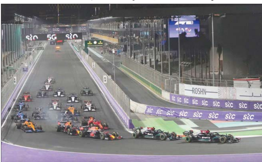
جانب من منافسات سباق «فورمولا 1» الذي جرت أحداثه على حلبة كورنيش جدة

وأكد هاميلتون أن فيرستابن «تخطى الحدود» مرة أخرى، واتهم هاميلتون نظيره الهولندي بأنه كان يختبر المكابح الخاصة به، عندما اصطدم بالجزء الخلفي لسيارة فيرستابن. ونجح المتسابق البريطاني لويس هاميلتون؛ سائق فريق «مرسيدس»، في حسم لقب سباق «جائزة السعودية الكبرى لفورمولا 1»، بعد حصوله على المركز الأول في الجولة 21 (ما قبل الأخيرة) من موسم سباقات «فورمولا 1» - 2021، بعد منافسة شرسة مع الهولندي ماكس فيرستابن سائق فريق «رد بول» الذي حل ثانياً، فيما حطفت الفنلندي فاليري بوتاس