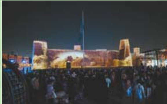
توافد كبير من الزوار لمشاهدة العروض الضوئية