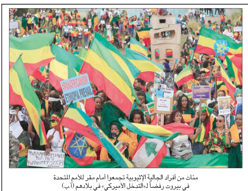
مئات من أفراد الجالية اللبنانية تجمعوا أمام مقر للأمم المتحدة في بيروت رفضاً لـ«الشرق الأوسط» في بلادهم

ضمان الأراضي إلى المازوت، وهنا الكارثة الزراعية والاقتصادية».