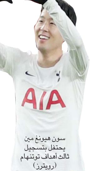
سون هيوونغ مين يحتفل بتسجيل ثالث أهداف توتنهام (رويترز)

استهل مانشستر يونائيد مسيرته مع مدربه الألماني رالف رانغنيك على أفضل وجه، بتحقيق انتصار ثمين 1 - صفر على ضيفه كريستال بالاس ضمن المرحلة الخامسة عشرة من بطولة الدوري الإنجليزي الممتاز،