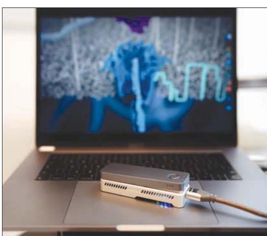
توضيح الشاشة التي تظهر في الخلفية عملية تليق شريط الحمض النووي عن طريق جهاز تحديد التسلسل

وتتضمن تقنية IDMseq، التي طورها فريق كاوست، إضافة ترميز شريطي مميز إلى كل جزيء من جزيئات الحمض النووي في عينة من الخلايا، يليها إنتاج عدد كبير من النسخ لكل جزيء باستخدام