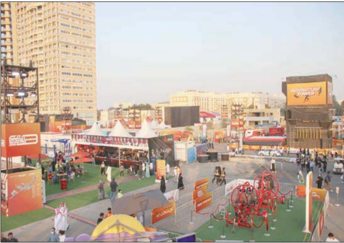
فعاليات عدة شهدها اليوم الأخير لسباق الفورمولا