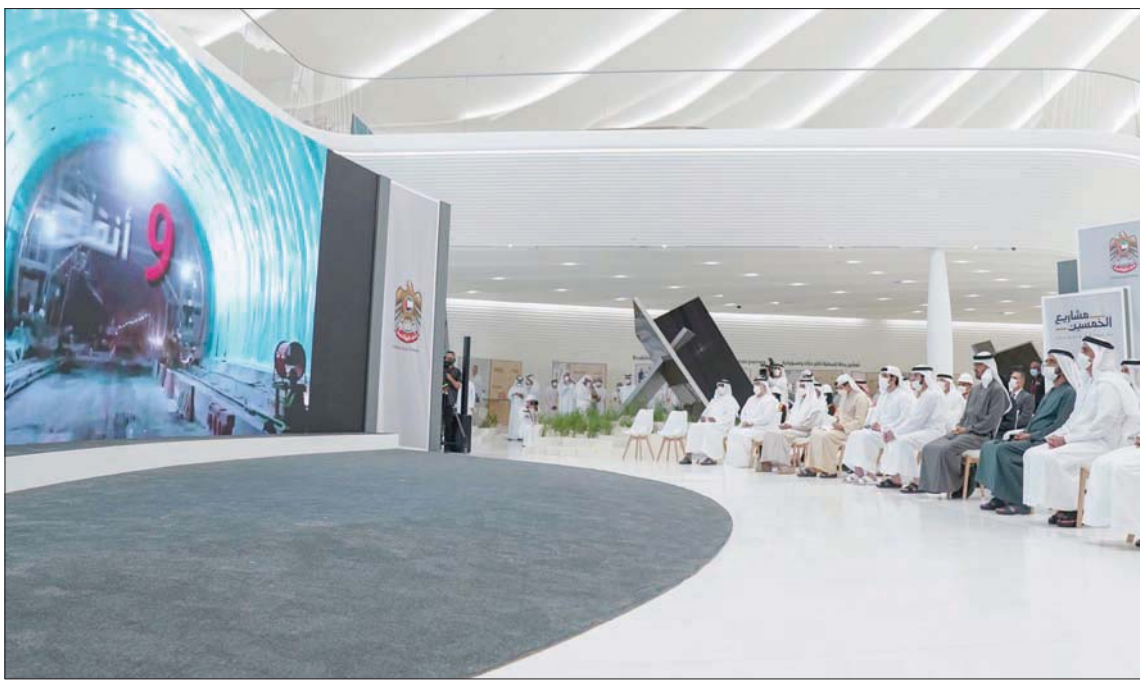
جانب من فعالية خاصة في «إكسبو دبي» بحضور الشيخ محمد بن راشد والشيخ محمد بن زايد وعدد من المسؤولين الإماراتيين (الشرق الأوسط)

وقالت الإمارات إنه سيتم من خلال البرنامج الوطني للسكك الحديدية تطوير منظومة نقل شاملة ومتكاملة مما يفتح فرصاً اقتصادية تصل قيمتها إلى 200 مليار درهم (54,4 مليار دولار)؛ ومن المقرر أن تتولى الحكومة 100 دقيقة فقط. وبين العاصمة والفجيرة نقله نوعية في منظومة النقل الكاربونية 21 مليار درهم (5,7 مليار دولار)، كما سيتم توفير 8 مليارات درهم (2,1 مليار دولار) من تكلفة صيانة الطرق، بالإضافة إلى تحقيق فوائد سياحية تقدر قيمتها بنحو 23 مليار درهم (6,2 مليار دولار) خلال الـ 50 عاماً المقبلة.