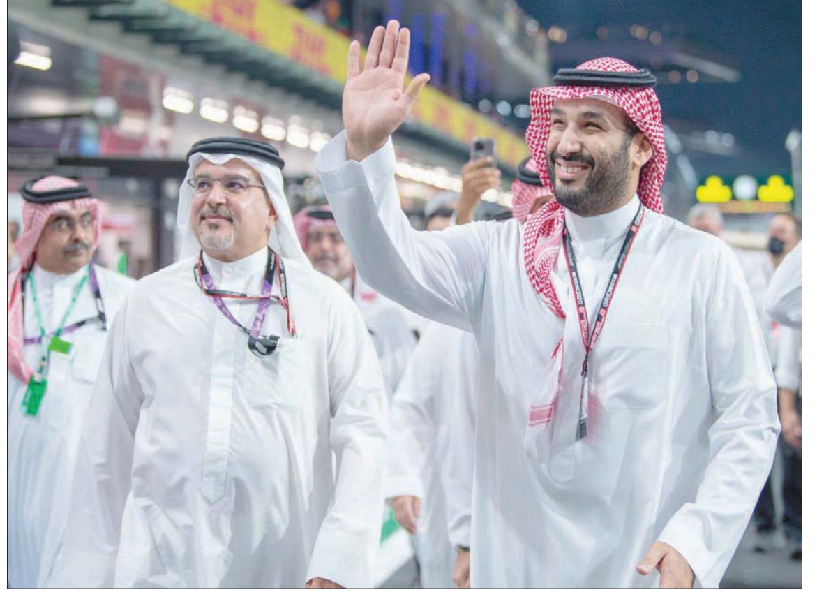
ولي العهد السعودي يحيي الجماهير الحاضرة في السباق وإلى جانبه الأمير سلمان بن حمد

صعب تجاوزها هناك في أبوظبي، المشاعر كبيرة داخل السيارة والمقصورة بعد الفوز»، مختتماً حديثه: «الحملة تشكل تحدياً كبيراً من الناحية الجسدية والعقلية». فيما أوضح الهولندي ماكس فيرستابن، سائق فريق «ريد بول» الذي كان يسيّر في طريقه للفوز قبل أن يتراجع في اللغات الأخيرة نحو المركز الثاني، والمنافسة قائمة حتى الجولة الأخيرة.