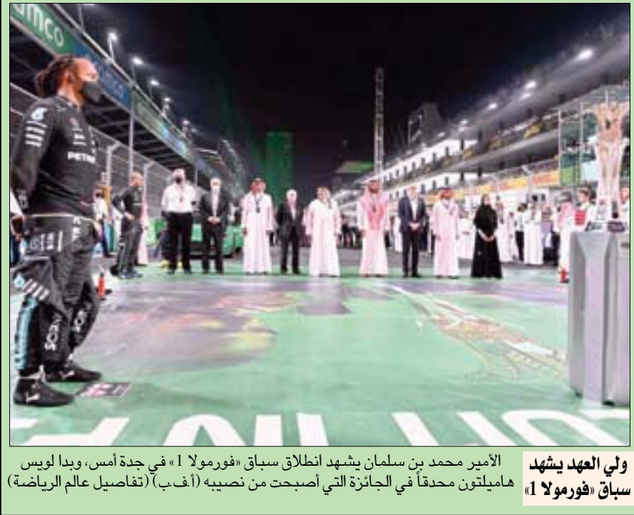
ولي العهد يشهد سباق فورمولا 1 في جدة أمس، وبدا لويس هاميلتون محققاً في الجائزة التي أصبحت من نصيبه (تفاصيل عالم الرياضة)