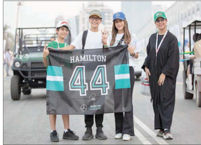
مشجعون من جميع الجنسيات شهدوا سباق الفورمولا في جدة