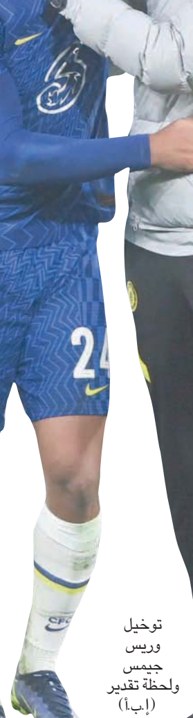
توكيل وريس جيمس لحظة تقدير (إبأ)

تجاهلنا روميلو لوكاكو، الذي انضم إلى تشيلسي وهو في الثامنة عشرة من عمره قبل أن يعود مرة أخرى هذا الصيف، فإن اللاعبين الصاعدين من أكاديمية الناشئين لأفضل لاعبي 27 في المائة من إجمالي عدد الدقائق التي لعبها الفريق وسجلوا ما يقرب من ثلث الأهداف. ولا تقتصر هذه الظاهرة على تشيلسي فقط، فإذا القينا نظرة على جميع مباريات الدوري الإنجليزي الممتاز في نهاية هذا الأسبوع، فسجد أن جميع المباريات - باستثناء مباراة واحدة فقط - شارك فيها لاعب من خريجي أكاديمية