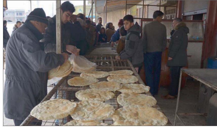
ازدحام أمام أحد الأفران العامة في القاسملي للحصول على رغيف الخبز

مع استمرار إضراب المطاحن السياحية، الخاصة بريف دير الزور الشرقي، الخاضعة لقوات سوريا الديمقراطية (قسد)، عادت أزمة الخبز وتوزيع مخصصات الطحين المدعومة لتظل براسها من جديد بعد الإضراب المفتوح لأصحاب الأفران، الذي دخل يومه العاشر، حيث نظم الأهالي احتجاجات رفضاً لتخفيض الكميات المخصصة وزيادة سعر الكيس المدعوم، ما فاقم الأوضاع الإنسانية في السنة الثانية من معاناة المنطقة من الجفاف.