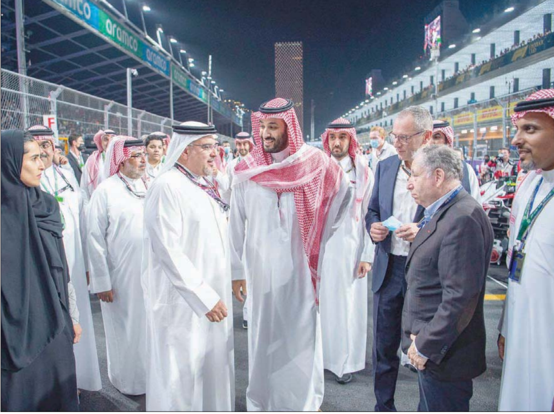
الأمير محمد بن سلمان في حديث مع ولي عهد البحرين بحضور كبار مسؤولي السباق