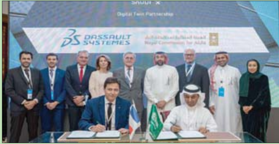
جانب من التوقيع على الاتفاقيات الأربع بين «العالا» السعودية ومؤسسات فرنسية (الشرق الأوسط)