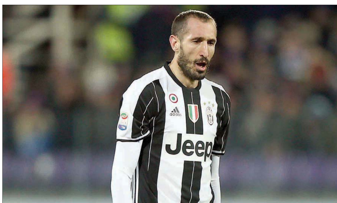
جورجيو كيليني

وقد سُئلت بعد تلك المباراة عن رأيي، وقلت بصراحة إنني لا أعرف بالضبط ما يجب القيام به، لكن ما أعرفه هو أننا بحاجة إلى بذل المزيد من الجهد