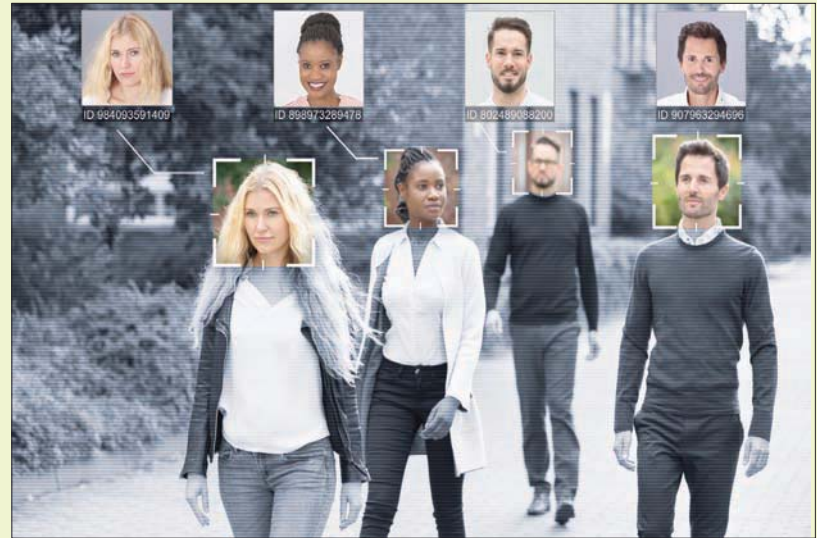
لندن - واشنطن، «الشرق الأوسط»

كهربائية أكثر نشاطاً أثناء معالجة التعرف؛ ما يعني أن دماغهم تشهد أحياناً فورات في النشاط الكهربائي تفوق قدرة تحكمهم.