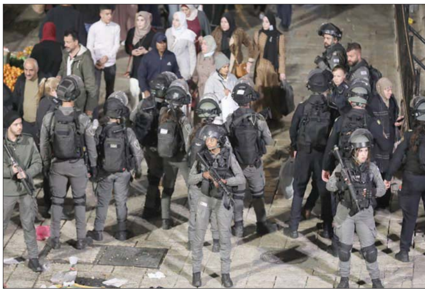
الشرطة الإسرائيلية في موقع حادث الهجوم الذي وقع السبت في القدس القديمة

وفي الجانب الفلسطيني، نشر مكتب الرئيس محمود عباس، بياناً ندد فيه بإطلاق النار ووصفه بأنه «اعتقال». وحثّ المجتمع الدولي على «التحرك الفوري لوقف جرائم إسرائيل». وطالبت وزارة الخارجية والمغتربين، المجتمع الدولي، بإعادة النظر في كل ما يسمى «الإرهاب» الذي تطلقه إسرائيل جازفاً بحق الفلسطينيين تحت الاحتلال، وتقييم ودراسة سلوكيات الاحتلال برئته، عقب احتضان أركان الحكومة الإسرائيلية لقتل الشاب محمد غانم: «نقذت قوات حرس الحدود في القدس ما هو واضح وهو تحييد المُنذَر بالوسائل التي معها وباحتراف، ويظهر من المواد التي لدينا ومن التحقيق الأولي ما جرى، وأسعى لدعم القوات». وكان الوزير العربي في الحكومة وزير التعاون الإقليمي عيساوي فريج، من حزب اليسار «ميرتس»، وحججاً في انتقاد سلوك الشرطة، فقال، خلال