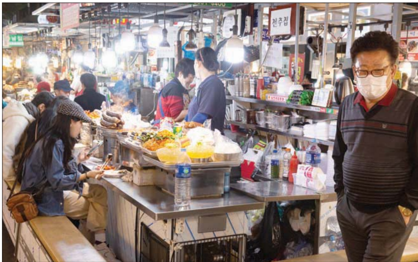
ارتفعت أسعار البقالة والمشروبات 5% في الفترة من يوليو حتى سبتمبر الماضيين (إبأ)

فيما تستمر عملية التصديق لدى الخضر حتى الآن. ومن المقرر أن يعلن الاشتراكيون الديمقراطيون أسماء وزراءهم، بينما أعلن حلفاؤهم باعتبارهم منضمات بيئية أن محتوى وثيقة التحالف لن يكون كافياً لوضع ألمانيا على طريق حصر الانحترار في 1,5 درجة مئوية المتصور عليه في اتفاقية باريس بشأن حماية المناخ.