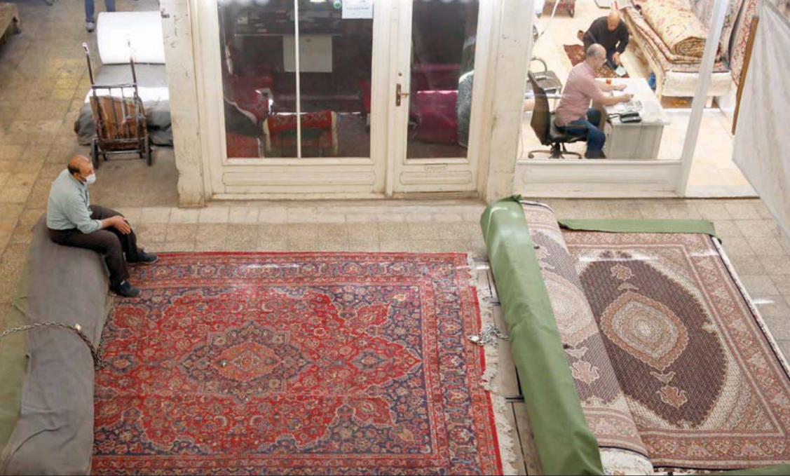
هوى الريال الإيراني بعد تواتر أنباء عن مصاعب تواجه المحادثات فيما تعاني الأسواق من تراجع القدرة الشرائية للمواطن (إ.ب.)

الأيام الأخيرة شاهداً عدداً من السيناتورات ونواب الكونغرس هددوا بأن اميركا ستسحب من الاتفاق النووي في حال وصل رئيس جمهوري إلى السلطة». وكان لافتاً أن المسؤول الإيراني لم يرغب في الخوض بشأن المقترحات في المسودة الخاصة بالالتزامات النووية التي يمكن أن توافق عليها طهران للعودة إلى الالتزامات النووية، أو ما إذا كانت تعود للالتزامات المنصوص عليها في الاتفاق، بعدما سارعت برنامجهما النووي، على مختلف المستويات.