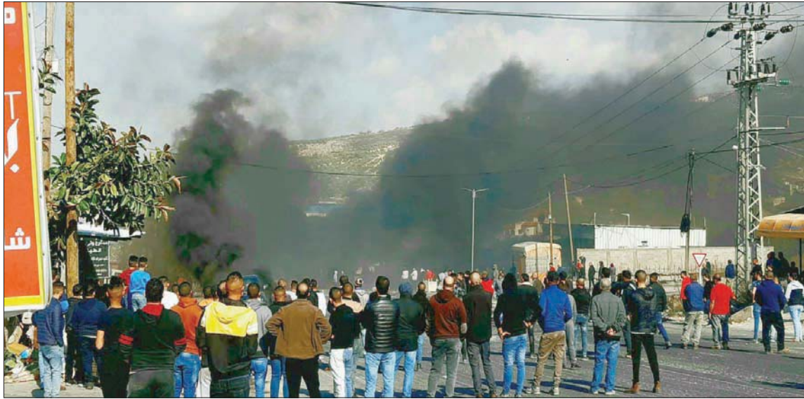
صور متداولة على مواقع التواصل لإغلاق الشوارع في جنين أمس

الغضب الفلسطيني على مواقع التواصل الاجتماعي تحول إلى عاصفة، خصوصاً مع تزايد جرائم القتل واستخدام السلاح بشكل فوضوي. وشهدت جنين نفسها مجموعة من حوادث إطلاق النار خلال الشهور القليلة الماضية، بحيث اضطرت السلطة معها لإطلاق حملة أمنية متاخرة، ردعاً لعشرات المسلحين هناك.