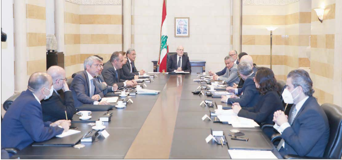
جانب من جلسة سابقة للحكومة اللبنانية

محطة جديدة، ونحن ندافعنا وساعدنا في إيجاد المناخات الملائمة لكي تقر برنامجاً إصلاحياً حقيقياً نستطيع معه أقله أن نضع أنفسنا على سكة المعالجة لأوضاع الناس الاقتصادية والمالية والاجتماعية. لن نياس وسبقي لدينا الأمل، وهو أصل مرتبط بكتنبر من المعطيات لأننا قادرون على الخروج من أزمنا، ولكن هذا الخروج يتطلب جرة في المعالجة للحزب، ومنطق الضغوط الذي يمارس على الأجهزة القضائية والتنفيذية في البلد، مزيد من الضغط والحصر والتصفية السياسية».