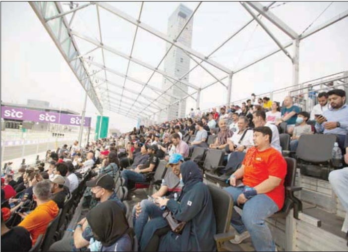
مدرجات الحلبة امتلأت منذ وقت مبكر قبل السباق الكبير