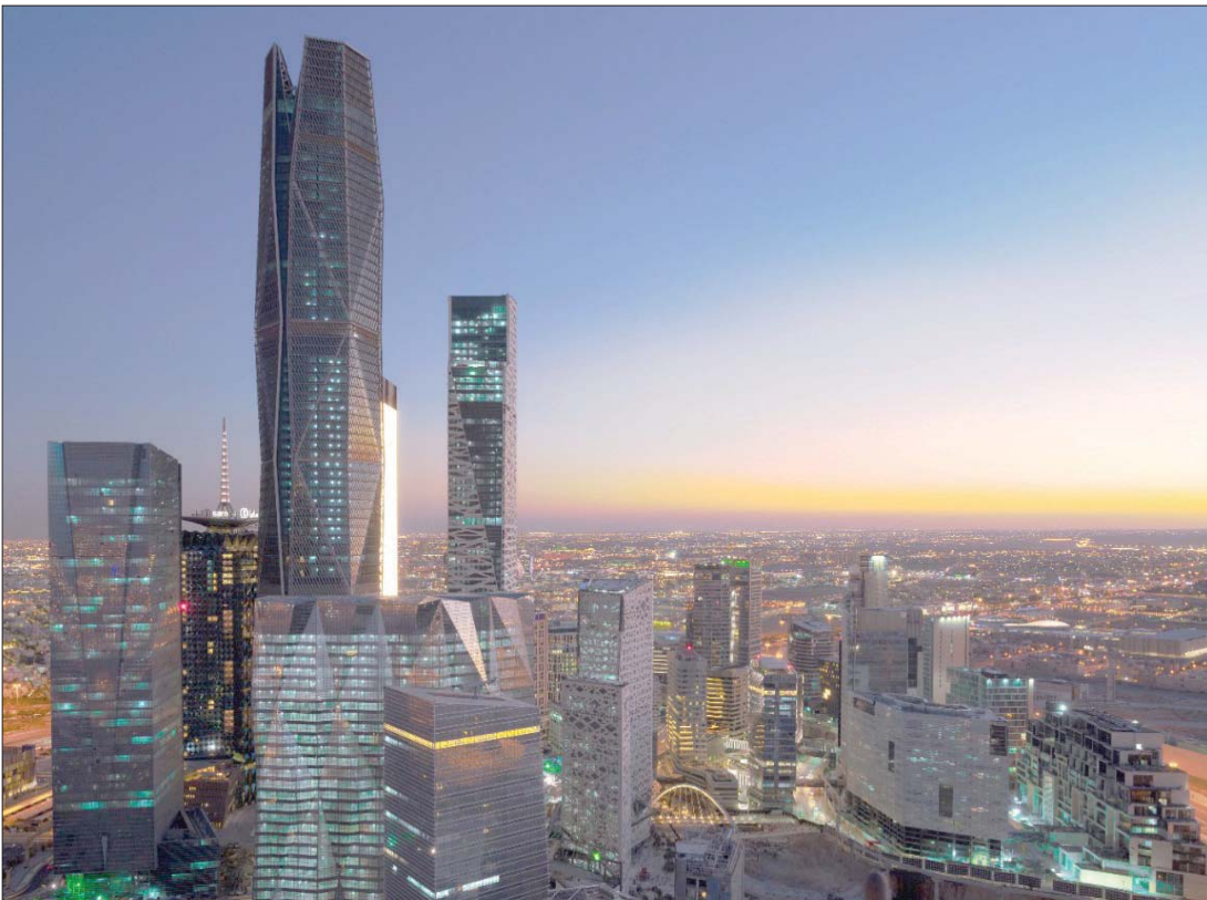
سجلت السعودية 56,9 نقطة خلال نوفمبر بدعم من القطاع الخاص غير المنتج للنفط (الشرق الأوسط)

وخلجيا، برز مؤشر مدير المشتريات لدولة قطر، حيث أظهرت البيانات تسجيل مؤشر قطر ارتفاعاً قياسياً للشهر الثالث على التوالي من 62,2 نقطة في أكتوبر إلى 63,1 نقطة في نوفمبر الماضي.