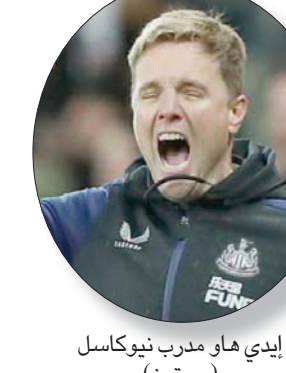
إيدي هاو مدرب نيوكاسل

جيمس بارك لأول مرة: «اعتقد أن هناك إيجابيات في الفريق، أنا أؤمن بذلك حقاً. نحتاج إلى التحسن في الصلابة الدفاعية والأداء، وأنا أعتقد أن ذلك قد حدث أمام بيرنلي، أتق أننا نستطيع أن نغفلها. لا يزال أؤمن أن الأمر بأيدنا. ويلتقي نيوكاسل مع ليستر سيتي الأحد المقبل ثم يدخل في ضغط المباريات المتتالية قبل أعياد الميلاد.