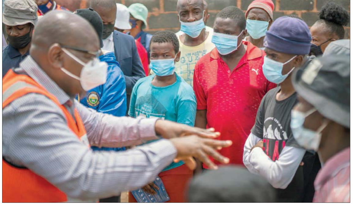
جنوب أفريقيا كثفت حملة التطعيم بالتزامن من انتشار المتحور الجديد

على الصعيد العالمي، هي اليوم التحدي الأكبر الذي يواجهه العالم في حربه المستمرة ضد «كوفيد-19» التي أوقعت حتى الآن 5,2 مليون ضحية، يربح الخبراء أنهم لا يتعدون ثلث العدد الفعلي للضحايا.