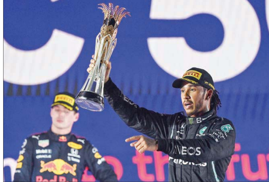
هاميلتون خلال تتويجه بجائزة السعودية الكبرى للفورمولا 1 ويبدو من خلفه فيرستابن