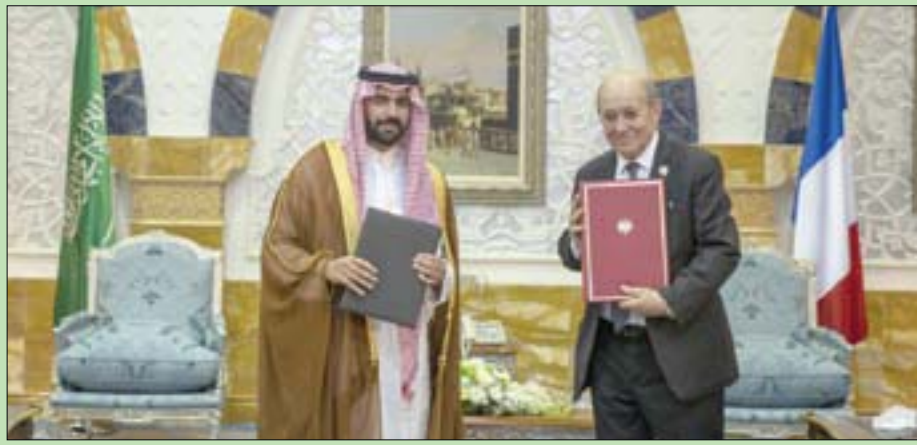
وزير الثقافة السعودي ووزير الخارجية الفرنسي أثناء التوقيع على الاتفاقيات (الشرق الأوسط)