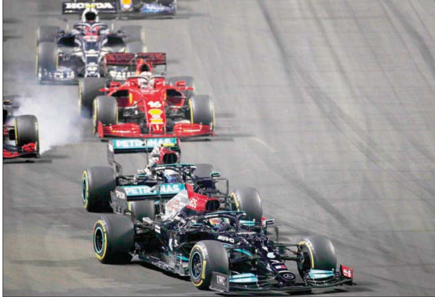
هاميلتون تفوق في السباق بعد جولة مثيرة مع فيرستابن

ولدى وصول ولي العهد السعودي حلبة كورنيش جدة كان في استقباله الأمير عبد العزيز الفيصل وزير الرياضة، والأمير خالد بن سلطان رئيس الاتحاد السعودي للسيارات والدراجات النارية، وكبار مسؤولي «فورمولا 1». وكان البريطاني لويس هاميلتون أرحباً بحسم لقب بطولة العالم لسباقات «فورمولا 1» إلى السباق