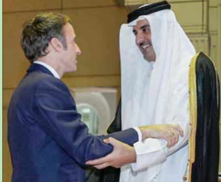
الرئيس الفرنسي مع ولي عهد أبوظبي في معرض «إكسبو دبي»... وفي وقت لاحق أمس ملتقى أمير قطر في الدوحة

برلين، راعداً بهتمام واشنطن، علي بردي انتهت سابع جولات محادثات فيينا لإحياء الاتفاق النووي بـ«خيبة أمل»، و«قلق» بعد خمسة أيام على استئناف المسار الدبلوماسي بين إيران والقوى الكبرى. وقال دبلوماسيون من الثلاثي الأوروبي إن طهران تتخذ موقفاً مدمراً في المفاوضات النووية محذرين من تقلص فرصة التوصل لحل النزاع