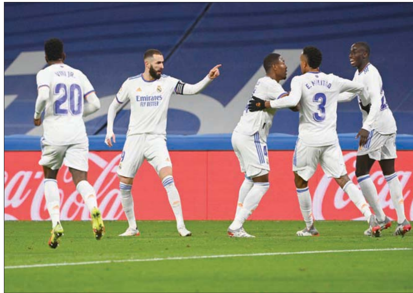
بنزيمة يواصل التالوق والتهديف مع ريال مدريد

أما إسبيلية، فيسافر الأربعاء إلى النمسا بعد مواجهته الصعبة السبت مع فياريال، لمواجهة ريد بول سالزبورغ في الجولة الأخيرة من منافسات المجموعة السابعة التي يحتل فيها المركز الثالث بفارق نقطتين عن ليل الفرنسي المتصدر ونقطة عن ضيفه النمساوي الثاني. والمهمة الأصعب على