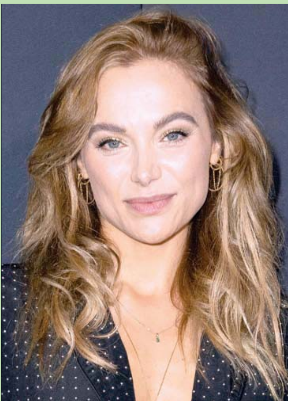
المثلة الأميركية كريستينا أوتشوا حضرت العرض الأول لفيلم «إنكونتر» في لوس أنجلوس (أ.ف.ب)

هل صحيح أن امرأتين صنعان (مرافعة)، وثلاثاً يحدثن (ثرثرة كبيرة)، أربعاً يصنعن (سوقاً كاملة)؟! *