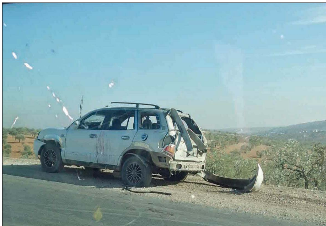
سيارة رباعية الدفع تضررت من غارة على دراجة في ريف إدلب شمال غربي سوريا أمس

وسبق أن غرقت التحالفات سلسلة غارات على قيادات تابعة لـ«القاعدة» أو فصائل قريبة منها. كما اغتالت أميركا زعيم «داعش» أبو بكر البغدادي في غارة في ريف إدلب في أكتوبر 2019.