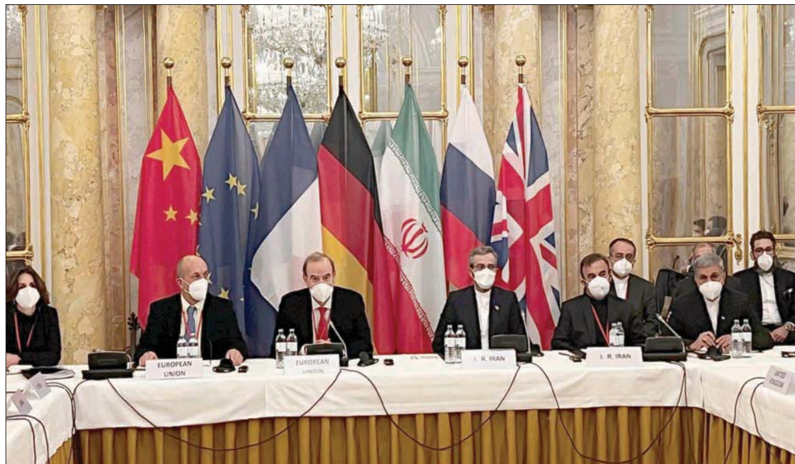
الاجتماع النهائي للجنة المشتركة لأطراف الاتفاق النووي في نهاية الجولة السابعة في فيينا أمس

بين الجانبين الأميركي والإيراني، حذر المتحدث من أن استمرار «التوسع الدراماتيكي وغير المسبوق» لبرنامجها النووي «يؤدي حتماً إلى أزمة». والقي باللوم على انسحاب إدارة الرئيس السابق دونالد ترامب من الاتفاق النووي في 2018. ووجد الحديث عن «بدل أفضل»، مشيراً إلى أن الرئيس جو بايدن «ملتزم إعادة تفعيل الشرع نفسه، هو يعني ذلك». وأكد أنه «إذا كانت إيران ملتزمة بالقدر نفسه، فالحل في المتناول. وإذا لم يكونوا كذلك، فلن يكون أمامنا خيار سوى السعي وراء خيارات أخرى». وأضاف: «نحن أقل قلقاً في شأن موعد استئناف المفاوضات من استئنافها بشكل بناء عندما يحصل ذلك، مع سعي كل الأطراف إلى التوصل والتفكير لعودة متبادلة سريعة إلى الامتثال الكامل».