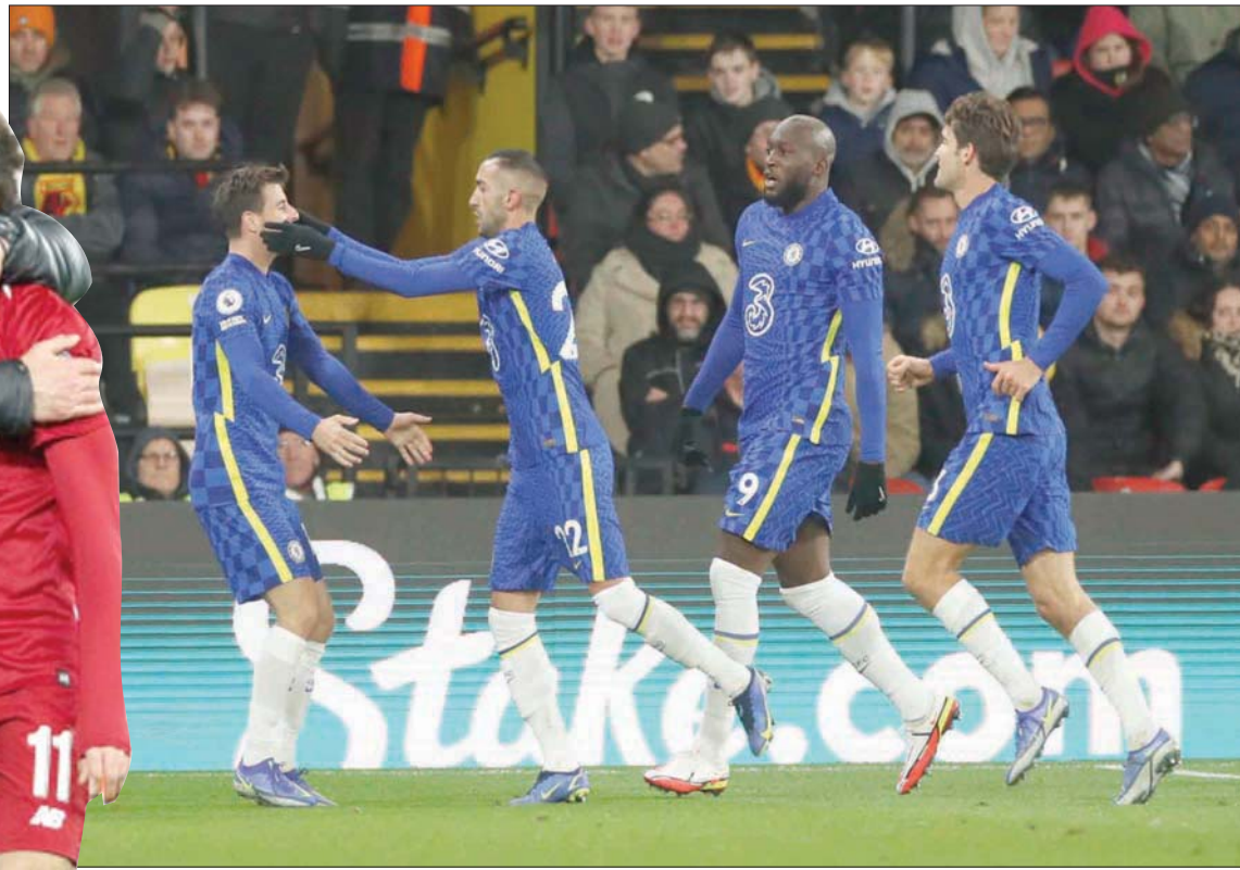
توخيل مدرب تشيلسي اعترف بأن فريقه كان محظوظاً بالفوز في وانفورد خلال المرحلة السابقة

داخيل الفريق أشهر على أن يتولى منصباً استثنائياً في النادي لمدة سنتين بعد ذلك، ويخوض رانغنيك أول مباراة رسمية له على ملعب «أولد ترافورد» ضد كريستال بالاس (الجمعة)، على شد الصفوف