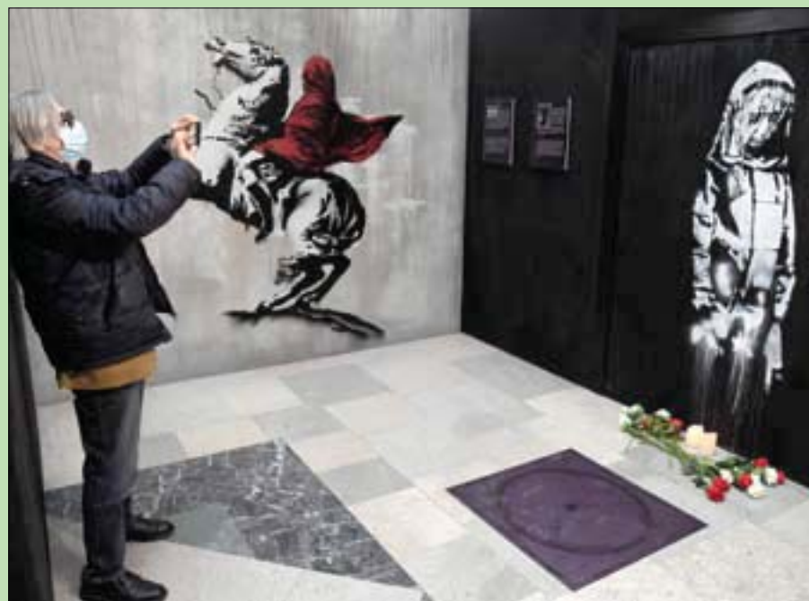
يقدم معرض ميلانو 130 نسخة بالحجم الطبيعي من أعمال فنان الشوارع البريطاني الغامض (إ.ب.أ)

خصوصاً أن معظمها تعرض للتدمير أو الحجب أو السرقة». وتعرض أكثر من 130 لوحة جدارية وطباعة شائسة حتى 27 فبراير (شباط) في قاعات هذه المحطة، وسط ديكور يعيد بامانة إنتاج عالم فنان بريستول الغامض.