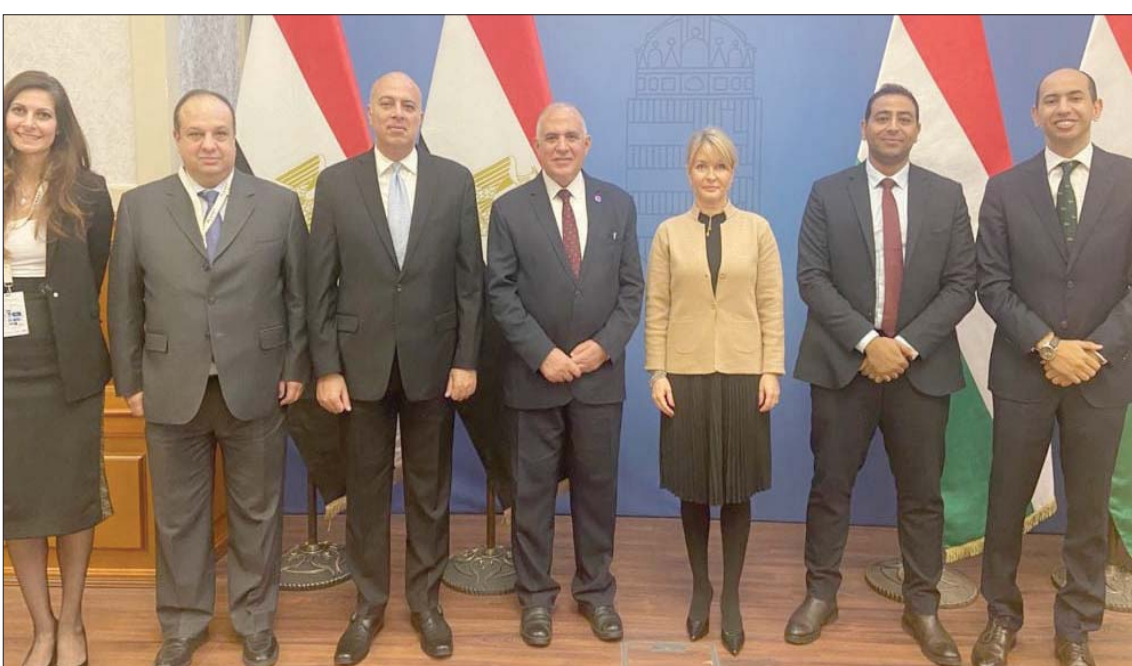
وزير الري المصري يتوسط مجموعة من الدبلوماسيين المصريين في بودابست

قبل، الأمر الذي يستلزم وجود آلية تنسيق واضحة وملزمة بين البلدين، وهو الأمر الذي ترفضه إثيوبيا، رغم أن مصر عرضت على إثيوبيا العديد من السيناريوهات، التي تضمن قدرة (السد) على توليد الكهرباء بنسبة تصل إلى 85 في المائة في أقصى حالات الجفاف»، مضيفاً أن «وجود تنسيقية في إطار اتفاق قانوني عادل، يُعد ضمن إجراءات التكيف مع الآثار السلبية للتغيرات المناخية»، موضحاً أن «مشروع الممر الملاحي بين بحيرة فيكتوريا والبحر المتوسط، الذي يهدف لتحويل نهر النيل لمحور للتنمية يربط بين دول حوض النيل، يحقق التكامل الإقليمي ويجمع دول الحوض». ووفق مجلس الوزراء المصري، مساء أول من أمس، فقد أكد الوزير عبد العاطي أن «مصر تعتمد بنسبة 97 في المائة على مياه نهر النيل، وتصل احتياجات مصر المائية إلى نحو 114 مليار متر مكعب سنوياً مقابلها موارد مائية لا تتجاوز الـ60 مليار متر مكعب سنوياً، بعجز يصل إلى 54 مليار متر مكعب سنوياً». في سياق مواز، التقى وزير الري المصري، امس، على هامش مؤتمر «كوكب بودابست»، وزير المياه والبيئة الأوغندي ساد مانجوشو شيبوتوريس، ووزير الطاقة والمياه الأنغولي لوكريسيو الكسندر، ووزير الموارد المائية السيراليوني فيليب لانسانا، وكريم حسني وزير الموارد المائية الجزائري، لبحث تعزيز التعاون.