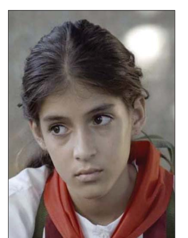
مشهد من فيلم «إيزابيل»