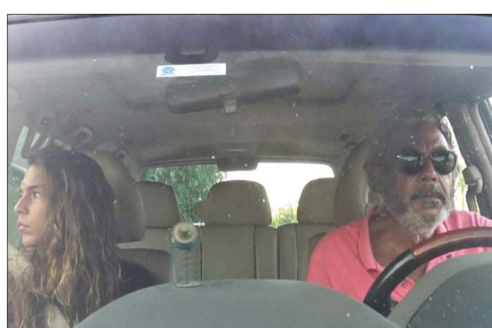
لقطة من فيلم «العودة»