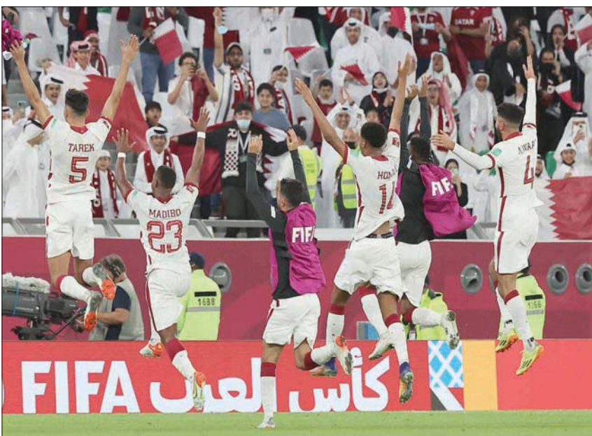
لاعب قطر يحتفلون بتأهلهم المثير إلى ربع النهائي

وحسم تعادل سليلي مخيب مواجهة العراق والبحرين على استاد الثمامة.