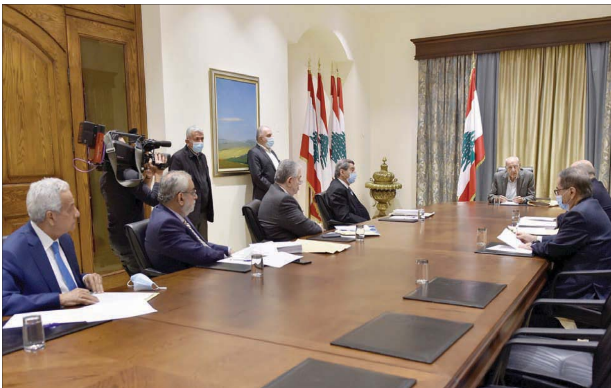
الرئيس نبيه بري مترسماً اجتماع هيئة مكتب مجلس النواب أمس

لإدراجه بعد الطعن»، لافتاً إلى أن «مسألة الدعوة للهيئات الناجبة تتم بناءً على اقتراح وزير الداخلية وتصدر بمرسوم موقع من رئيس مجلس الوزراء ورئيس الجمهورية ودعا لتدخل بحق رئيس الجمهورية بالتوقيع على عدمه».