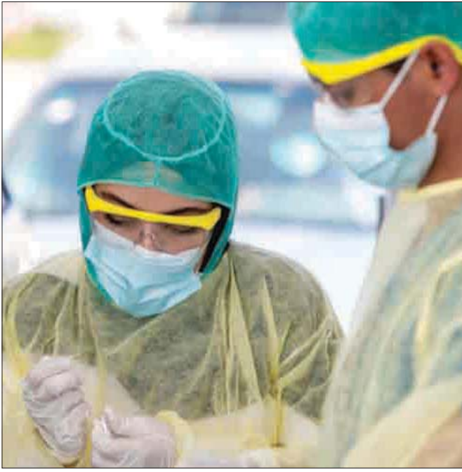
حملة نشطة لفحوصات «كورونا» في المملكة منذ بداية الجائحة

الاحترازية والبروتوكولات الوقائية للنصي للجائحة والحد من انتشار الفيروس. وجرى خلال الاجتماع مراجعة المستجدات وتقييم الوضع الراهن بشأن السلالة المتحورة الجديدة من فيروس كورونا «أوميكرون» وأعمال التقصي وإجراءات فحص التسلسل الجيني. وأكدت اللجنة ضرورة تكثيف جميع الجهود من كل الجهات للتعامل مع مستجدات الوضع الوبائي، والإشراف على التزام الجميع بتطبيق الإجراءات الوقائية المعتمدة.