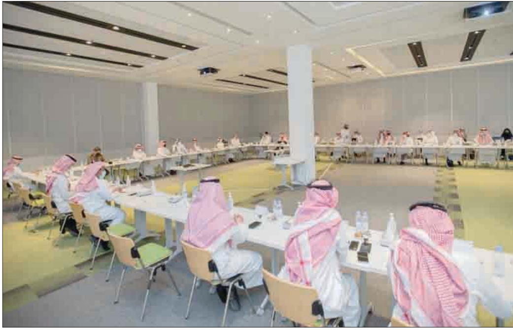
اجتماع اللجنة المعنية باتخاذ الإجراءات الاحترازية لمنع تفشي «كورونا» في السعودية

أقرت السعودية جرعة تنشيطية من لقاح «كورونا» كشرط لاستمرار ظهور حالة «محصن» في تطبيق «تولكنا»، وذلك ابتداءً من مطلع فبراير (شباط) المقبل، لدخول المنشآت الحكومية والخاصة والأنشطة والمناسبات واستخدام وسائل النقل، لكل من مضى 8 أشهر أو أكثر على تلقيهم الجرعة الثانية لللقاحات العمرية من 18 عاماً فأكثر. وأشار مصدر مسؤول في وزارة الداخلية السعودية إلى ما سبق الإعلان عنه من اشتراط التحصين وعلى ما رفعته الجهات الصحية من أهمية الحصول على الجرعات التنشيطية لللقاحات «كوفيد 19»، لتعزيز مستوى المناعة بين أفراد المجتمع والسيطرة على تفشي الفيروس، وخصوصاً سلالاته المتحورة. ولفت المصدر إلى ما أثبتته الدراسات من مأمونية الجرعات التنشيطية وفعاليتها وأهميتها نظراً لوجود فرص تراجع لمستويات الأجسام المضادة في الدم، بعد مضي 6 أشهر من تلقي الجرعة الثانية، ما يدعو إلى ضرورة التأكيد على من مضى 6 أشهر فأكثر على تلقيهم الجرعة الثانية، بالمسارعة إلى تلقي الجرعة التنشيطية. وأوضح المصدر أنه بداية من 1 فبراير المقبل سيتم اعتبار تلقي الجرعة التنشيطية شرطاً لاستمرار ظهور حالة «محصن»