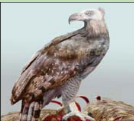
تصور فني لشكل نسر «هاست»

كان جورج قرداحي يعتقد أن العمل السياسي شغلة بسيطة وخلافات صغيرة يمكن حلها سريعاً بمجرد الاستعانة بصديق، أو مجموعة أصدقاء. لكنه وجد نفسه في بلد الأزمات الولادة. وهو الآن في مازق غير مريح على الإطلاق. فالبقاء حيث هو مشكلة، والخروج خسارة. وكلما خَبِلَ إليه أن مهارته تمكنه من ضبط الساعة، تبين له أن لبنان يعيش بجميع المواقف والساعات، وينام وفقاً لغرينتش، ويفيق على التوقيت الصيغى السريع الزوال.