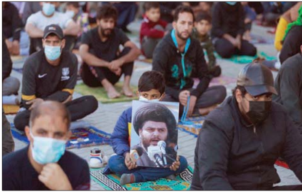
طفل يحمل صورة مقتدى الصدر خلال صلاة الجمعة في مدينة الصدر ببغداد أمس

بدا من دخوله مقر زعيم تحالف الفتح هادي العامري كان زعيم التيار الصدري مقتدى الصدر قد حسب كل خطوة من خطواته بما في ذلك طريقة أدائه التحية على زعامات الإطار التنسيقي وفي مقدمتهم خصمها اللدودان نوري المالكي، زعيم ائتلاف دولة القانون، وقيس الخزعلي، أمين عام عصائب أهل الحق.