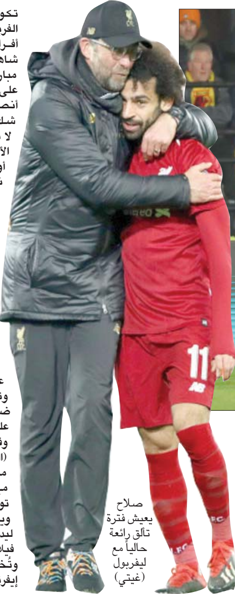
صلاح يعيش فترة تألق رائعة حالياً مع ليفربول

وكان يونايتد قد قال مديره السابق النرويجي أولي غونار سولسكاير، وعبر بعداً منه مؤقتاً مساعداً مايكل كاريك الذي أشرف عليه في ثلاث مباريات انتهت بفوزه خارج ملعبه ضد فياريال الإسباني 2 - 0. صفر وبلوغه دور السنة عشر من دوري الأبطال، وتعادله بعيداً عن قواعده ضد تشيلسي 1 - 1 ثم الفوز على أرسنال 3 - 2، الخميس. وفي مباريات أخرى يلتقي (اليوم) نيوكاسل ويونايتد مع بيرنلي، وساوثهامبتون مع برايتون، فيما سيضيف تشيلسي نورويتش سيتي، غداً، ويحل برنتفورد ضيفاً على ليفز يونايتد، ويستقبل أستون ليدز لستر سيتي، غداً، أيضاً، وتختتم المرحلة الاثني عشر بلقاء إيفرتون مع أرسنال.