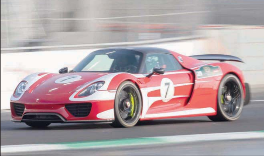
جانب من فعالية السيارات الخارقة على حلبة جدة

إلى جدة، للدخول في صراع الحصول على المركز الأول. وتأتي استضافة المملكة للفعاليات فورمولا 1 ضمن مبادرات برنامج جودة الحياة، أحد برامج تحقيق رؤية المملكة 2030 التي تقوم وزارة الرياضة بتنفيذها. وتساهم الفعالية المتميز في عدة رياضات إقليمية عالمياً، ضمن مبادرة استضافة استضافة الفعاليات العالمية في تعزيز قدرات وإمكانيات فرق رياضية النخبة، ما يساهم في تحقيق الإنجازات الرياضية المتميزة للمملكة إقليمياً وعالمياً.