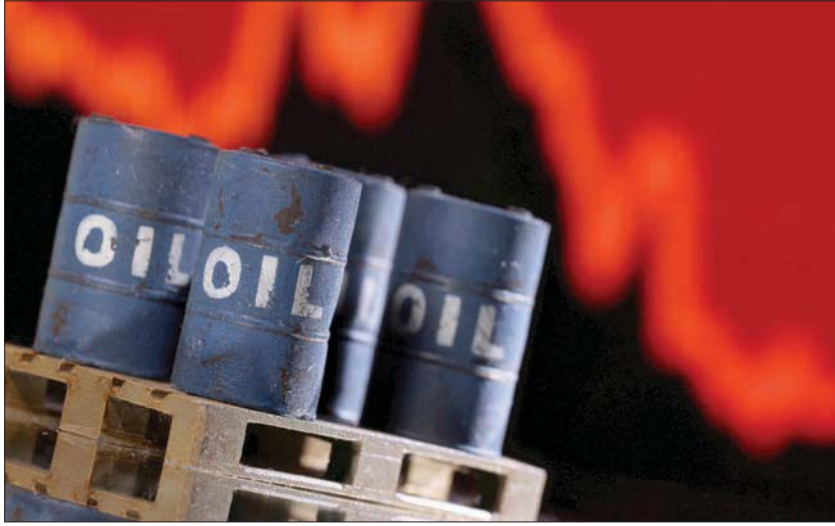
المتحدة باسم البيت الأبيض: نقدر مستوى التنسيق الوثيق مع شركائنا في السعودية

الأسواق مساء الخميس عندما أعلنت التمسك بخطط زيادة إنتاج النفط شهريا بواقع 400 ألف برميل أخرى يوميا في بنابر (كانون الثاني) المقبل. غير أن المنتجين تركوا الباب مفتوحاً أمام تغيير السياسة سريعاً إذا تضرر الطلب من إجراءات احتواء «أوميكرون». وقالوا إنهم قد يجتمعون مجدداً قبل اجتماعهم التالي المقرر في الرابع من يناير (إذا لم الأمر). وقال البيت الأبيض يوم الخميس، إنه يرحب بقرار (أوبك) وحلفائها زيادة إنتاج النفط تدريجياً، لكنه أضاف أن الولايات المتحدة ليست لديها خطط لإعادة النظر في قرارها السحب من احتياطات الخام. وقالت المتحدثة باسم البيت