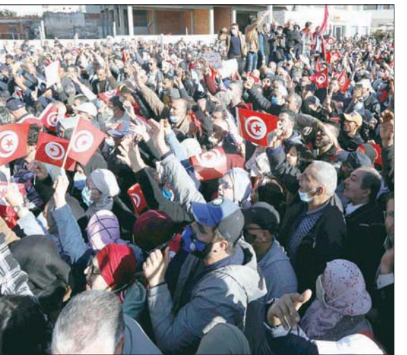
محتجون ضد سياسات الرئيس قيس سعيد أمام البرلمان التونسي

وإلى جانب وزير الخارجية المغربي، في اجتماع مشترك مع نظيره الليبي، لبحث الخطوات المقبلة.