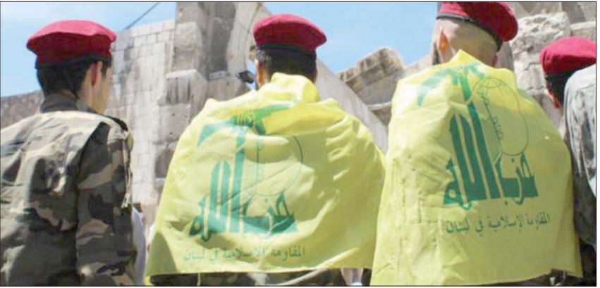
يرفعون رايات لـ«حزب الله» في سوريا في 15 مايو الماضي

المحلية وغير المحلية من جنسيات عراقية وأفغانية ولبنانية وغيرها، بالإضافة إلى عملها على المدى البعيد لزرار أممي ومدني من عوائل العناصر والقائدات التابعات لميليشياتها، بحيث بمنطقة السيدة زينب، وذلك عبر تسهيل عمليات تشييد الأبنية في بلدة «الجدلية» وتسكين العوائل في مخيم «قبر الست» فضلاً عن سيطرة وتواجد الميليشيات التابعة لها ضمن مقرات ومعسكرات، بدأ من منطقة السيدة زينب ومحيطها، ووصولاً إلى محيط مطار دمشق الدولي بالتوازي مع عمليات شراء العقارات والأراضي الزراعية بشكل خفي بمناطق الغوطة الشرقية التي كانت تعد من أبرز المناطق المناهضة للنظام السوري، ومعقلاً كبيراً لفصائل المعارضة سابقاً، بالإضافة إلى وضع ثراء تجريبها أيضاً في مدن وبلدات ريف دمشق الجنوبي، القريبة والملاصقة لمنطقة السيدة زينب».