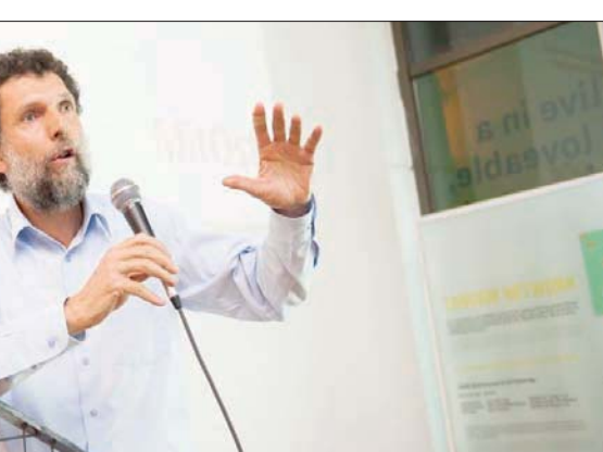
رجل الأعمال التركي عثمان كافالا الذي تتهمه السلطات بالجنس والتورط في محاولة انقلاب فاشلة وتمويل احتجاجات في إسطنبول (رويترز)

إصدار قبرص ترخيصاً للتقيب عن الغاز الطبيعي في منطقة قالت إنها تنتهك الجرف القاري لتركيا في شرق البحر المتوسط. وكرهت في بيلجيتش، في بيان آخر، بشأن أنباء عن منح الحكومة القبرصية ترخيصاً لكونسورسيوم بين شركة «إكسون موبيل» و«قطر للبترول» للتقيب عن الغاز الطبيعي فيما يسمى بالمنطقة الخامسة في شرق المتوسط، إن «الأنباء المتعلقة بمنح ترخيص للتقيب عن الغاز فيما حددتها قبرص من جانب واحد وبشكل يتجاهل حقوق بلدانا وحقوق القبارصة الأتراك، تظهر مجدداً وبوضوح من بؤج التوتر في شرق المتوسط». ولفت إلى أن الترخيص المذكور ينتهك جزءاً من الجرف القاري لتركيا، ومن جهة أخرى، تتجاهل هذه الخطوة الذين هم شركاء في ملكية جزيرة قبرص، وأكد بيلجيتش أن تركيا لم تسمح في السابق لأي دولة أجنبية أو شركة أو سفينة بالتقيب عن النفط والغاز في مناطق الصلاحية البحرية التابعة لها دون ترخيص منها، ولن تسمح بذلك مستقبلاً. وشدد على أنها ستواصل الدفاع عن حقوقها وحقوق القبارصة الأتراك في شرق المتوسط.