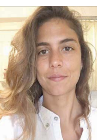
المخرجة سارة الشاذلي