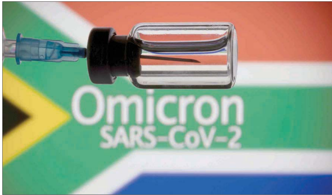
ملصق للتوعية بالمتحور «أوميكرون»

تتراوح أعمارهم بين عشرين وأربعين سنة، وهم الفئة التي تتختم عادة بحماية مناعية عالية لمقاومة الفيروس.