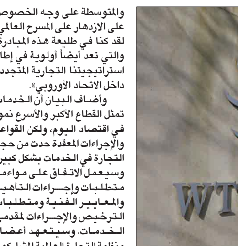
اختتمت 67 بلداً عضواً بمنظمة التجارة العالمية مفاوضات حول اتفاقية تاريخية لخفض روتين تجارة الخدمات وتبسيط اللوائح المعقدة

وتمتوسطة الحجم التي ليس لديها نفس الموارد والخبرة للتعامل مع العمليات المعقدة مثل منافسها «الكبار». علاوة على ذلك، ستساعد الاتفاقية الاتحاد الأوروبي فيما يتعلق بالأجندة الرقمية، حيث ستستفيد منها قطاعات مثل الاتصالات، وخدمات الكمبيوتر، والهندسة، والخدمات المصرفية التجارية. كما أنها المرة الأولى التي تدرج فيها منظمة التجارة العالمية نصوصاً ملزمة بشأن عدم التمييز بين الرجل والمرأة بحسب البيان. وقال نائب الرئيس التنفيذي للمفوضية والمفوض التجاري