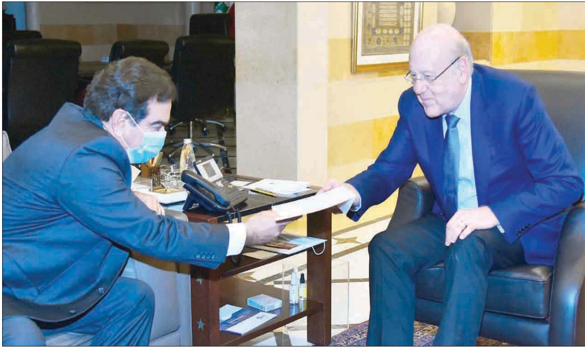
قرداحي يسلم الرئيس نجيب ميقاتي كتاب استقالته أمس

وأضاف: «من هذا المنطلق إننا حريصون على تطبيق ما ورد في البيان الوزاري لحكومتنا لجهة تعزيز علاقات لبنان مع الدول العربية الشقيقة والإصرار على التمسك بها والمحافظة عليها، والحرص على تفعيل التعاون التاريخي بين بلداننا العربية والنائي بالنفس عن التدخل في الشؤون الداخلية للدول العربية وفي أي نزاع عربي - عربي، ودعوة الأشقاء العرب للوقوف إلى جانب لبنان في هذه المحنة التي يبرز تحتها شأنهم دائماً مشكورين». وشدد ميقاتي على أن الحكومة «عازمة على التشدد في اتخاذ الإجراءات الكفيلة بضبط الحدود البحرية والبرية ومنع كل أنواع تهريب الممنوعات التي تضر بامن الدول العربية الشقيقة وخصوصيتها، ولا سيما منها دول الخليج والسعودية بشكل خاص». معلنًا أن «الحكومة على استعداد لإنشاء لجنة مشتركة للبحث في كل الأمور والسهل على حسن تطبيقها». وأكد رفض الحكومة «كل ما من شأنه الإساءة إلى أمن دول الخليج واستقرارها»، وقال إنها «تدعو كل الأطراف اللبنانية إلى وضع المصلحة اللبنانية فوق كل اعتبار، وعدم الإساءة