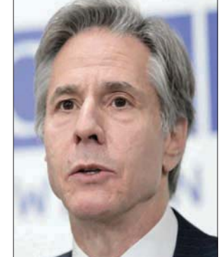
وزير الخارجية الأمريكي أنتوني بليكن

بايدن لحكومة بنيت منذ توليها زمام القيادة في إسرائيل، في يونيو (حزيران) الماضي. وقال موقع الإبراني في الاتصال الذي جرى بين رئيس الوزراء الإسرائيلي نفتالي بينيت ووزير الخارجية الأمريكي أنتوني بلينكن، كشفت مصادر في تل أبيب أن موضوع قرارات توسيع الاستيطان اليهودي في الضفة الغربية، احتل حيزاً في الاتصال. وقالت المصادر إن بليكن طالب بنيت بضرورة وقف الاستيطان في الضفة الغربية والامتناع عن أي إجراءات أحادية الجانب، وأكد أن القرارات الصادرة لتوسيع الاستيطان من شأنها أن تزيد التوتر، وأن تعرقل الجهود المبذولة لإحياء مفاوضات التسوية السلمية. وذكرت المصادر أن طلب بليكن هذا يعتبر خامس أو سادس رسالة توجهها إدارة الرئيس الأمريكي جو