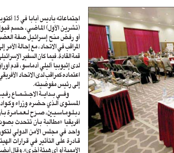
المؤتمر الثامن رفيع المستوى للسلام والأمن بأفريقيا في مدينة وهران الجزائرية (إبأ)

وإلى جانب وزير الخارجية المغربي، في اجتماع مشترك مع نظيره الليبي، لبحث الخطوات المقبلة.