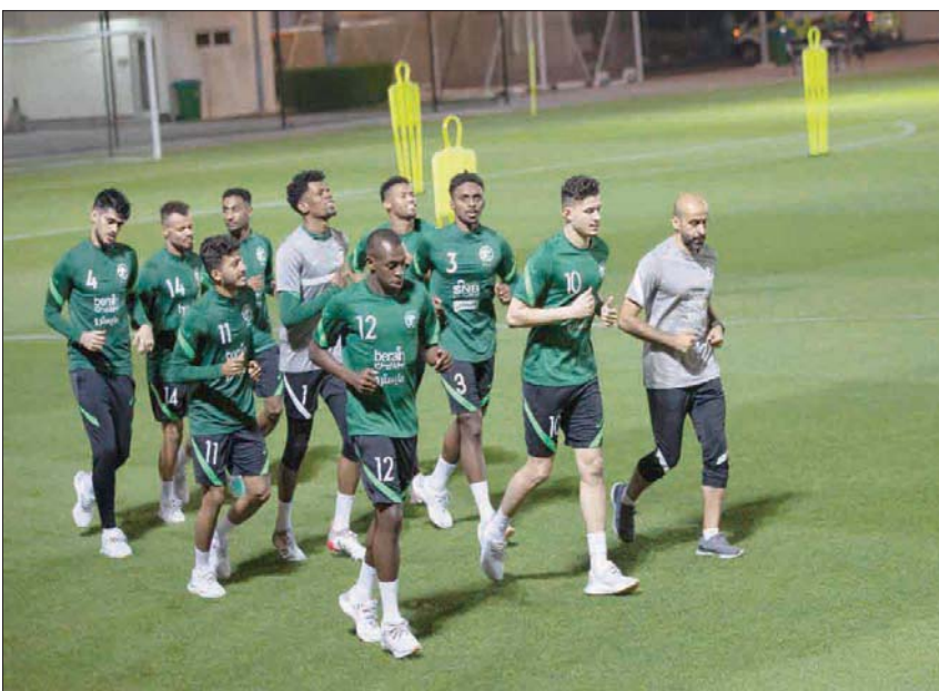
من تدريبات المنتخب السعودي أمس استعداداً لمواجهة فلسطين

وهذا التعادل هو الثالث للبحرين أمام العراق بقيادة البرتغالي هيليو سوزا الذي حقق انتصارين على منتخب «أسود الرافدين».