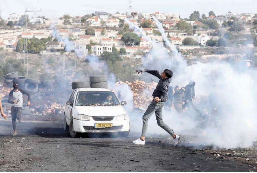
متظاهرون فلسطينيون خلال مواجهات مع قوات إسرائيلية في قرية كفر قدوم بالضفة الغربية