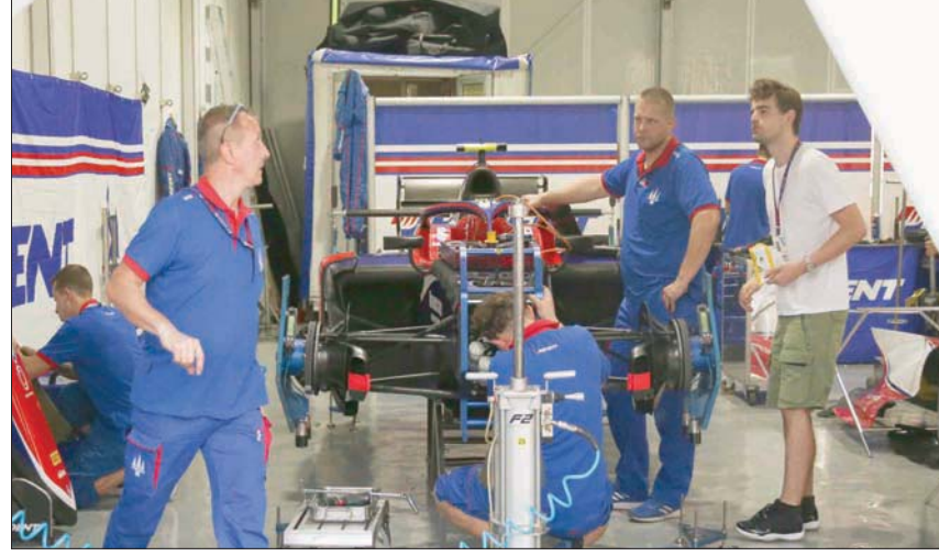
أحد الفرق المشاركة في السباق خلال عملية الفحص

ويتصدر الهولندي ماكس فيرستابن سائق «ريد بول» الترتيب العام للسائقين خلال عام 2021، بـ 351 نقطة وبفارق 8 نقاط فقط عن لويس هاميلتون سائق فريق «ميرسدس»، الذي يوجد في المركز الثاني مباشرة خلفه بـ 343 نقطة، لذلك فإن شكل الخنافس النهائي بين الثنائي على حلبة جدة قد يحدد بصورة مباشرة الفائز بالمقرب هذا العام.