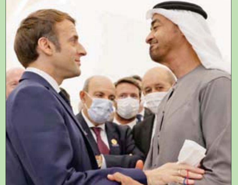
دبي، «الشرق الأوسط» الرياض، فتح الرحمن يوسف

والمبادرات السلمية التي تهدف إلى ترسيخ أركان الأمن والاستقرار في المنطقة. ورت الرئاسة الفرنسية، في بيان، أن الاتفاقات مع الإمارات تعد «إنجازاً كبيراً للشراكة الاستراتيجية بين البلدين». كما قال ماكرون للصحافيين في دبي: «هذا الالتزام الفرنسي في المنطقة، وهذا التعاون النشط في مكافحة الإرهاب، والمواقف الواضحة التي اتخذناها تعني أننا زدننا من قربنا من دولة الإمارات العربية المتحدة». (تفاصيل ص2)