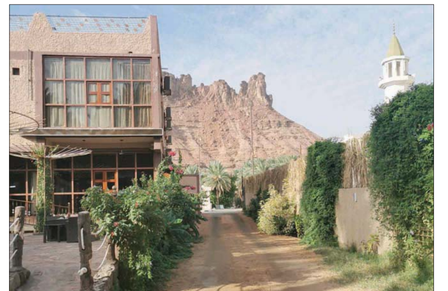
تُقام الدورة الأولى للبرنامج بأحد بيوت الضيافة في قلب واحة العُلا (ماي ولورث)

ويأتي برنامج الإقامة الفنية ضمن شراكة الهيئة الملكية لمحافظة العُلا مع الوكالة الفرنسية لتطوير محافظة العُلا، وقد تم اختيار شركة «مانيفستو» كمشغل للبرنامج بناءً على خبرتها الواسعة في تفعيل الجهات الثقافية من خلال ربط الجهات الفاعلة فنياً وثقافياً بمشاريع التنمية، بالإضافة إلى دعمها فيما يخص التوجيه الفني وإدارة الفنانين.