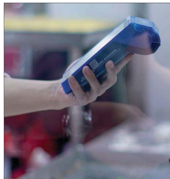
توقع تضاعف حجم الاقتصاد الرقمي الاستهلاكي في الشرق الأوسط إلى 100 مليار دولار عام 2030

لندن: «الشرق الأوسط»، حذرت كريستالينا غورغيفيا، مديرة صندوق النقد الدولي، يوم الخميس، من أن الدول الفقيرة قد تواجه انهياراً اقتصادياً ما لم تتفقد الدول الأكثر ثراءً في العالم على تخفيف جهود تخفيف أعباء الديون. وقالت غورغيفيا في مدونة شاركت فيها جيليا بازار باشي أوغلو، مديرة إدارة الاستراتيجيات والسياسات والمراجعة بصندوق النقد، إن نحو 60% من البلدان المنخفضة الدخل تعاني بالفعل أعباء الديون أو معرضة لهذا الخطر بشدة مقارنة بأقل من نصف هذه النسبة في عام 2015. وحذرت غورغيفيا وبازار باشي أوغلو، من أن «التحديات تصاعدت بالنسبة للكثير من هذه البلدان»، وقالت: «قد نشهد انهياراً اقتصادياً في بعض البلدان ما لم يتفق الدائنين بمجموعة العشرين على تسريع إعادة هيكلة الديون وتعليق خدماتها في أثناء التفاوض على إعادة الهيكلة». وطلقت مجموعة العشرين للدول صاحبة الاقتصادات الكبرى مبادرة تعليق خدمة الديون في ربيع 2020 والتي تهدف إلى تجديد مؤقت لمدفوعات البلدان المنخفضة الدخل التي واجهت الكثير منها بالفعل أعباء ديون ثقيلة قبل انتشار جائحة «كوفيد-19». ومع ذلك سينتهي سريان هذه المبادرة بحلول نهاية العام. وشان البطء الشديد التقدم في خطة أخرى لمجموعة