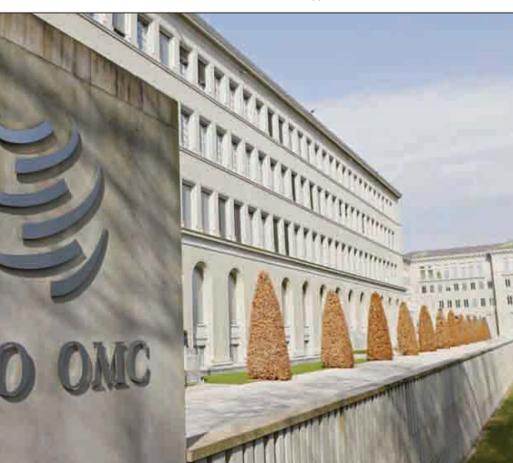
اختتمت 67 بلداً عضواً بمنظمة التجارة العالمية مفاوضات حول اتفاقية تاريخية لخفض روتين تجارة الخدمات وتبسيط اللوائح المعقدة

بروكسل، «الشرق الأوسط»، اختتمت مجموعة من 67 عضواً في منظمة التجارة العالمية، بما في ذلك الاتحاد الأوروبي، مفاوضات حول اتفاقية تاريخية مع الاستمرار في تيسير السياسة النقدية من جانب البنك المركزي. وأطاح الرئيس التركي رجب طيب أردوغان، فجر أول من أمس، وزير الخزانة والمالية لطفى إيلوان، آخر المعارضين لسياسته في خفض سعر الفائدة، وذلك بعدما طفا الخلاف بينهما على تسير السياسة النقدية في ظل ارتفاع التضخم على السطح مؤخراً. وعين أردوغان مكان إيلوان، نور الدين باتي، الذي كان واحداً من 4 نواب للوزير، وهو أيضاً نائب سابق بالبرلمان عن حزب «العدالة والتنمية» الحاكم. كما أقال أردوغان، منذ يونيو (حزيران) 2019، ثلاثة رؤساء للبنك المركزي بعدما عارضوا رغبته في خفض سعر الفائدة الرئيسي.