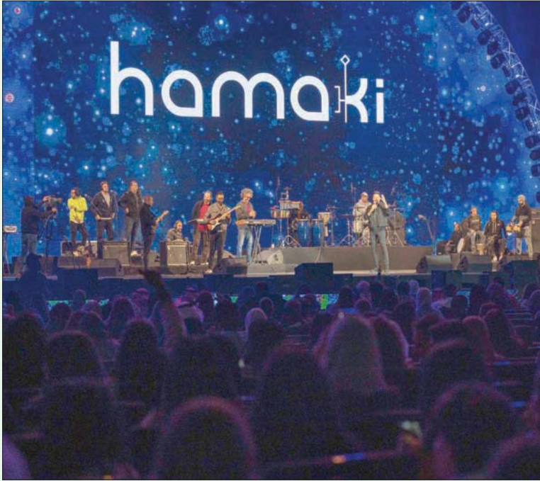
محمد حماتي على مسرح الراحل أبو بكر سالم في بوليفارد الرياض

السعودي يحبه، وهو يحبهم كما يكره دائماً. ومع أنوار هواتف الجماهير بدأ حماتي بكل حب وسطوة غناء «مابلش»، أحد أشهر أغانيه، ليمتج الحضور بصوته الهادئ وأحاسيسه الشعرية التي أخذت العاشق لمرحلة من الصفاء الذهني شكلتها طبقات صوته ودرجة الحرارة المنخفضة لتتحول إلى لحظات من الخيال يتبعها صوت حماتي.