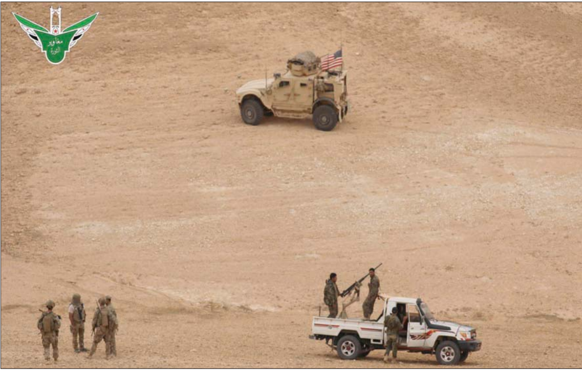
معارضون سوريون وجنود أميركيون خلال تدريبات في قاعدة التنف جنوب شرقي سوريا

المركزية السورية، وتواصل لتجنب قلب المحادثات لاستئناف المفاوضات النووية مع طهران، وذكر مسؤولون من الاستخبارات الإسرائيلية والأميركية، أن لديهم معلومات تشير إلى أن إيران كانت وراء العملية، حيث إن 3 طائرات من تلك التي شاركت في الهجوم لم تنفجر. وبعد فحصها، جرى التأكيد من أنها تستخدم تكنولوجيا نفسها التي تستخدمها ميليشيات مدعومة من إيران في العراق.