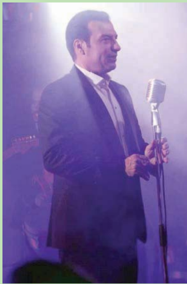
الفنان المصري إيهاب توفيق

عادة الجواهر النسيان واستبعاد الغائب من الصفوف الأولى. إيهاب توفيق كلما أرغم على الغياب، طرأ ما يعيد أخباره إلى ناسه. لم تهذا أطرقه، فالإبن الوحيد بعد رحيل الأب، وجد نفسه بين أبوين يحتاجان إليه. استأذن الفنان الوقت وطلب منه فترات استراحة. ترغم الحياة المرء على الاختيار بين السائل وتلعبه على أصابع المفاضلة. ليس لك أن تحصل على كل شيء، يقول الوقت لإيهاب توفيق الذي يختار بر والديين. قد تتعرض الأيام ما فات من فن، وتعب الحن فيعود الإنسان إلى نشاطه. استحقاق الأهل لا يحتمل التأجيل.