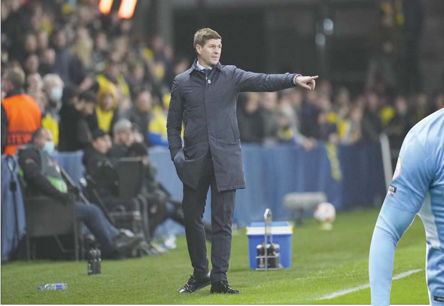
البيئة الحالية للدوري الإنجليزي التي انضم إليها جيرارد مؤخراً أصبحت صعبة للغاية

نقطة أو أكثر. لكن يوجد شيء أكثر إثارة للاهتمام يحدث الآن، وهو أن الدوري الإنجليزي الممتاز قد استفاد من الأزمة المالية التي سببها فيروس «كورونا»، بسبب قوة صفقة البث التلفزيوني للدوري. فرغم أن أندية الدوري الإنجليزي الممتاز شهدت تراجعاً في الإيرادات بمتوسط 59 مليون يورو (50 مليون جنيه إسترليني) في موسم 2019 - 2020 فإن هذا العجز كان أقل نسبياً من العجز الذي عانت منه الأندية في أي من البطولات الخمس الكبرى الأخرى. وهناك فئة من اللاعبين - مثل سون هيونغ مين، ويوري تيليمانز، وأولي واكينز - كان من الممكن أن تنتقل إلى دوريات أخرى لو لم يحدث ذلك، وفي الوقت نفسه، أصبحت أندية الوسط في الدوري الإنجليزي الممتاز قادرة على ضم المواهب من الخارج بضمن بخص نسبياً: لاعبون مثل بوبكاري سوماري، والكس كرال، وليون بابلتي. وقد أدى ذلك إلى تقوية وتعزيز صفوف هذه الأندية، ونتيجة لذلك لم يشعر أي شخص بما فعله شيفيلد يونايتد وست بروميتش في هذه المرحلة من الموسم الماضي (رغم أن نوريتش سيتي قد يفعل ذلك قريباً أيضاً).