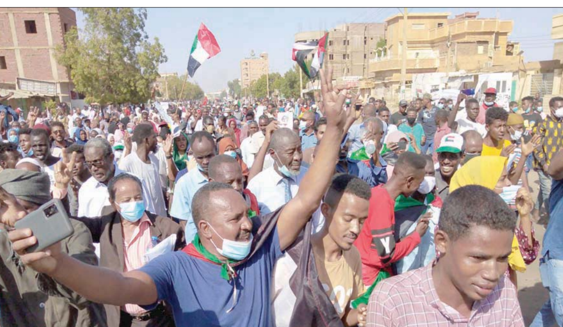
جانب من احتجاجات 17 نوفمبر في مدينة أم درمان (أفب)

السيادي. وكان قد قال لـ«الشرق الأوسط» في وقت سابق إنه لن يعود للحرب لأي سبب من الأسباب. ودرج قائد الجيش الفريق أول عبد الفتاح البرهان، على التزديد دائماً عزمه على إطلاق سراح المعتقلين السياسيين باستثناء الذين يواجهون بلاغات جنائية، ومنذ تلك التصريحات من قرابة الشهر، ولم يطلق سراح سوى أربعة من وزراء الحكومة الانتقالية منذ أيام، في الوقت الذي تواصل فيه الاعتقالات وحملات الدهم والتفتيش والاعتقال للقادة السياسيين والنشطاء وقادة لجان المقاومة الشعبية، ليتجاوز عدد المعتقلين مئات في عدد من المدن البلاد المختلفة، بما في ذلك العاصمة الخرطوم.