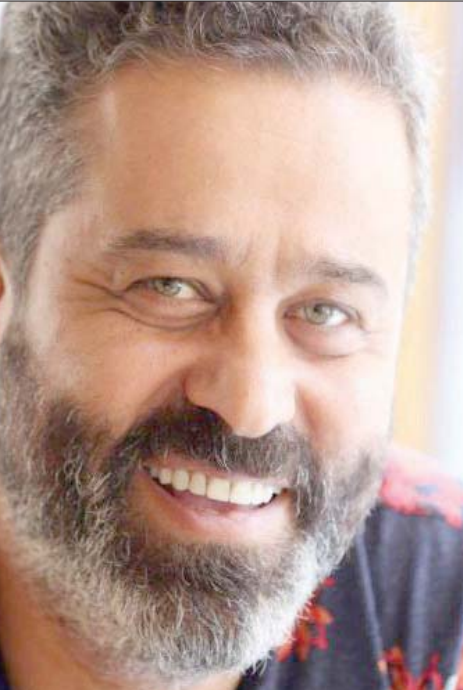
المخرج سامر البرقاوي

وكمخرج تعامل مع هذا الموضوع بمسؤولية، سيما وأن الأحداث تشكل الحركة الأساسية فيه، وهذه السنة يرتبط مصيرها بمصير المكان ولذلك أطلقنا عليها اسم «الهيبة - جبل». فالعنوان الفرعي يترك دائماً أجوبته للحكاية نفسها ويشير إلى محورها الأساسي. وهل تعني أن الجميع يخرج فائزاً من عمل تخرجه فلا يشعر بالخين؟ «يجيب: «اعتني بأدق التفاصيل لدى كل شخصية تشارك في العمل، وعلى اختلاف المساحة المخصصة لها والتأثير الذي