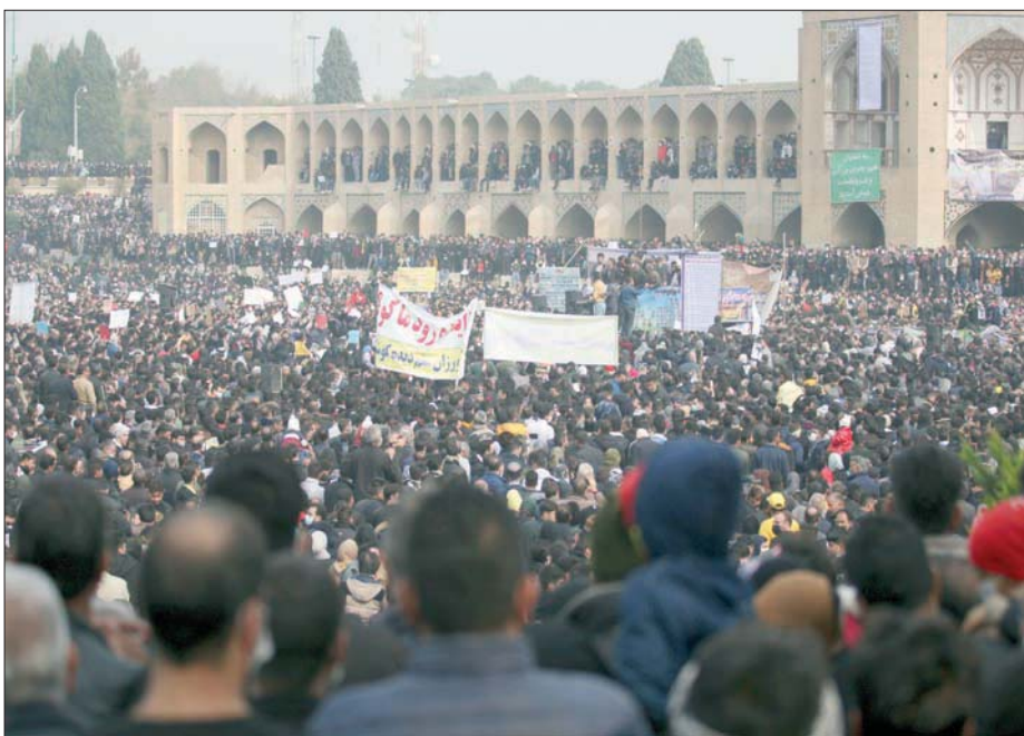
احتجاجات المزارعين أمس على تجفيف نهر زاينده رود

تغير احتجاجات أهل أصفهان، نالته كبرى مدن إيران، ويبلغ عدد سكانها نحو مليوني نسمة، وتتضمن ساحة «نقش جهان» (رسم العالم) المدرجة على لائحة التراث العالمي لمنظمة اليونسكو. وقال محللون إن منشأة فولان أصفهان تستهلك مياه خمسة أضعاف ما يحتاج إليه المزارعون. وقال نائب رئيس الجمهورية محمد مخبر، للتلفزيون الرسمي، أمس: «طلب من وزارتي الطاقة والزراعة اتخاذ إجراءات فورية لإدارة المسألة»، مشدداً على أن الحكومة «تبحث