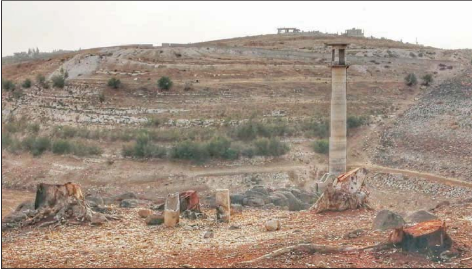
أشجار زيتون مقطوعة في ريف درعا جنوب سوريا (الشرق الأوسط)

الأمراض التي تصيب أشجار الزيتون نتيجة لغلأ أسعارها.