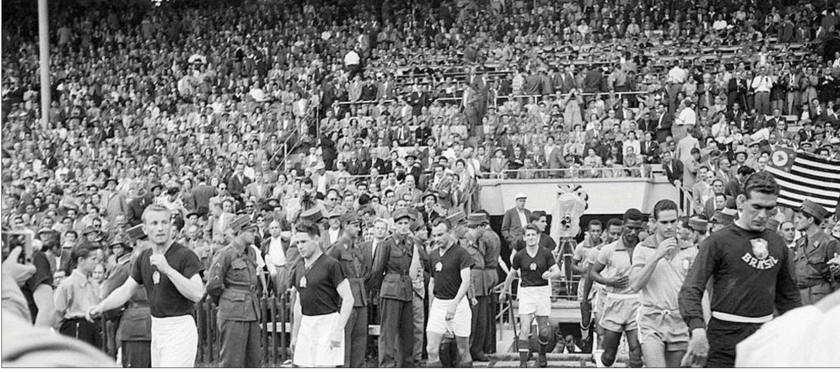
لاعبو منتخب المجر والبرازيل يدخلون إلى أرض الملعب قبل مواجهة الفريقين في ربع نهائي مونديال 1954 (غيتي)

لكن جزءاً مهماً للغاية من هذا التاريخ يتمثل في كيفية وصول هوغان إلى المجر في المقام الأول. لقد كانت الشخصية الرئيسية في تلك القصة لرجل إنجليزي آخر هو إدوارد شايرز، وهو بائع آلات كاتبة من بوليفيتون بالقرب من ماركسفيلد، والذي تُقرأ قصته العائلية وكأنها ملحمة تاريخية من القرن العشرين. وبينما كان هوغان يعاني من إصابة في الركبة أثرت كثيراً على مسيرته الكروية، فكر في الانتقال إلى عالم التدريب، لكنه كان يعلم جيداً أنه ليس له مكان في كرة القدم الإنجليزية، لذلك سعى للحصول على فرصة للتدريب في الخارج. وفي عام 1914 عُرض عليه القيام بدور في إعداد النمسا لدورة الألعاب الأولمبية لعام 1916 وكان هوغان قد أمضى شهرين في فيينا عندما اغتيل فرانز فريديماند في سراييفو. وبعد شهر، كانت بريطانيا في حالة حرب مع المجر والنمسا. وفي وقت مبكر من صباح الأحد الأيام، اقتحمت الشرطة