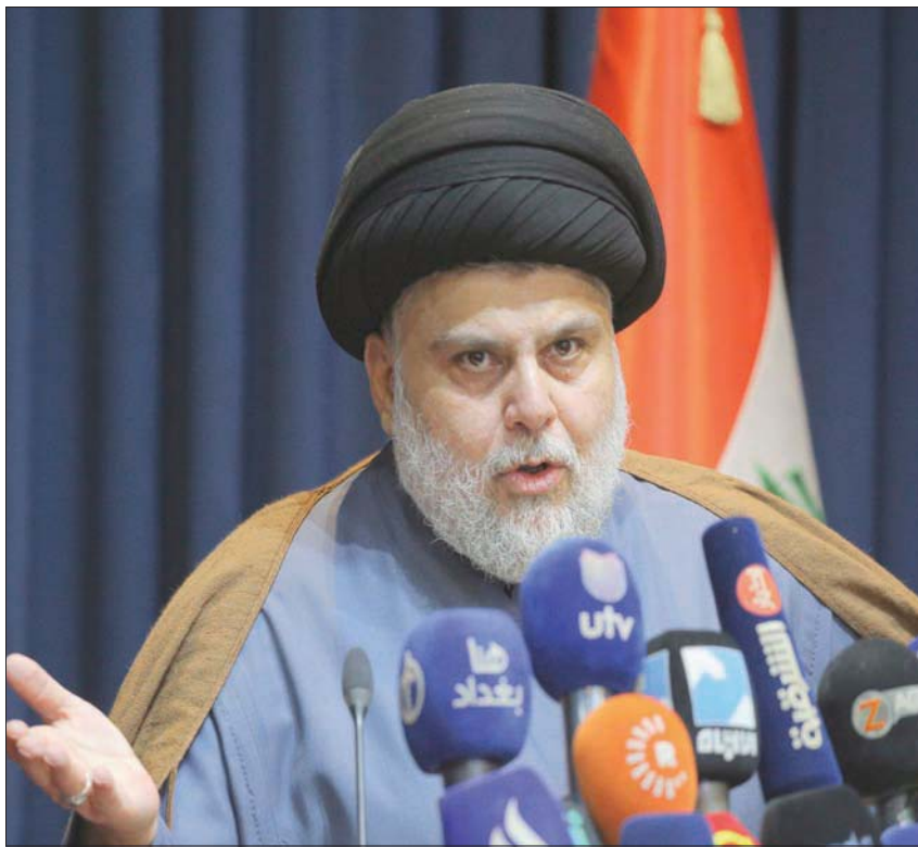
مقتدى الصدر يطرح مبادرته الجديدة في مؤتمر صحفي بالنجف مساء أول من أمس (أب)

العراقية.. لـ«الشرق الأوسط»، «إننا «تعودنا في العراق كلما تضطرب الأوضاع السياسية وعبر دورات البرلمان الخمس منذ 2006 وحتى 2021 وتصل بضغوط من المرجعية وإيران». الإطار التنسيقي الذي يضم الأحزاب الشيعية الخاسرة في الانتخابات، وهي تحالف (تحالف الفتح بزعامة هادي العامري، والعصائب بزعامة قيس الخزعلي، والحكمة بزعامة عمار الحكيم، والنصر بزعامة حيدر العبادي، بالإضافة إلى دولة القانون بزعامة نوري المالكي رغم تحقيقه فوزاً كبيراً يتجه الآن إلى طرق أبواب الأمم المتحدة ممثلة برئاسة بعثته جينين بلاسخرات التي سبق لهم أن طالبوا بطردها من العراق، ففي اجتماع الأخير الذي عقد مساء أول من أمس وبعد ساعات من مبادرة الصدر الذي تجاهلها بيانه تماماً، استضاف الإطار التنسيقي بلاسخرات لكي يقدم لها ما عده أدلة بشأن التزوير، مؤكداً على «المضي في المسار القضائي بالطعن بهذه النتائج وكل ما يتعلق بها والاستمرار في العمل وفق جميع الفعاليات التي كفلها الدستور». وفي سياق الأزمة الحالية، يقول الدكتور فاضل البدري، أستاذ الإعلام في الجامعة