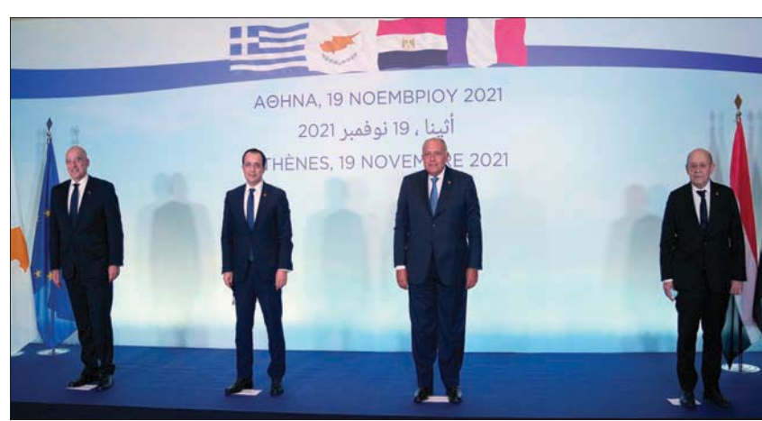
جانب من «اجتماع أئينا» بمشاركة وزراء خارجية مصر واليونان وقبرص وفرنسا

وتناولت القمة حينها عدداً من الملفات الإقليمية والدولية ذات الاهتمام المشترك، وعلى رأسها جهود مكافحة الإرهاب والهجرة غير المشروعة، ومستجدات الأزمت القائمة في المنطقة، خصوصاً ما يتعلق بالأزمة الليبية، وقضية «سد النهضة»، فضلاً عن الأوضاع في شرق المتوسط. وحسب بيان «الخارجية المصرية» أمس، فإن «الوزير شكري التقى خريستودوليدس لبحث الارتقاء بالعلاقات الثنائية، وسبل البناء على نتائج اجتماع (اللجنة العليا) التي عُقدت بالقاهرة في سبتمبر الماضي، على مستوى رئيسي البلدين». وفي سبتمبر الماضي أكدت مصر وقبرص واليونان «التنسيق بشأن القضايا محل الاهتمام المشترك، ودفع التعاون بين البلدان الثلاث