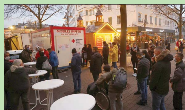
متسوقون ينتظرون دورهم أمام حاوية مخصصة للتطعيم ضد «كورونا» في سوق الكريسماس بمدينة جيبسن الألمانية أمس

«الأدوية الأوروبية» توصي باستخدام أقراص «ميرك» لعلاج المصابين «كورونا» يشلّ النمسا ويكبّل ألمانيا