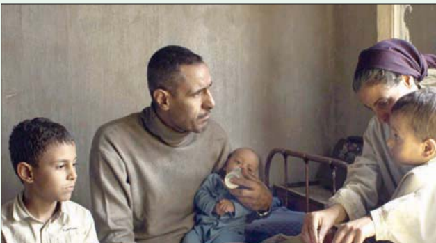
لقطة من فيلم «ريش»

وأعتبر حفطي (أحد منتجي فيلم «ريش») الجوائز المهمة التي حصدها الفيلم بمثابة رد اعتبار لصناع العمل، مشيراً إلى أن «ريش» تعرض للظلم «لم أتوقع رد الفعل على الفيلم عند عرضه في مهرجان الجونة، طبعاً، لأن بعض الناس لن يحبوا الفيلم، لكن لم أتوقع أن يصل الأمر إلى حد اتهامه بالإساءة لصر، وشعرت أنه تعرض للظلم كبير، لقد كنت وأناثق أنه فيلم جيد، رغم أنه ليس جماهيرياً، واستحقاقه الجوائز من (كان) إلى (الجونة) جميع المهرجانات التي شارك بها ردت له الاعتبار».