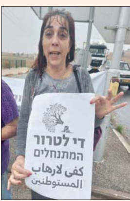
أنصار السلام اليهود والعرب يرفعون لافتات تدعو لعنف المستوطنين

كما أوردت صحيفة «هارتس» على لسان سكرتير عام الجمعية الاستيطانية «أمنا»، أن هناك 150 بؤرة ومزرعة استيطانية تنتشر في أنحاء الضفة تسيطر على 200 ألف دونم، وهي ضعف مساحة الأرض المبنية للمستوطنات. ويشير تقرير «بتسيلم» إلى أن الاحتلال الإسرائيلي استولى على أكثر من مليوني دونم من أراضي الضفة الغربية لغرض الاستيطان، وأقام 280 مستوطنة يسكنها 440 ألف مستوطن، بينها 138 مستوطنة تعترف بها إسرائيل بشكل رسمي (لا تشمل 12 حيا استيطانياً أقمتها على أراض ضمتها في القدس) ونحو 150 بؤرة ومزرعة استيطانية لا تعترف بها حكومة إسرائيل بشكل رسمي، أقيم ثلثها في العقد الأخير، وتُصنف على أنها مزارع استيطانية. ويشمل مسار اعتداءات المستوطنين للاستيلاء على الأراضي الفلسطينية: حرق مساجد وأشجار زيتون، سرقة محاصيل التفخير سيارات، سرقة محاصيل المزرعات الفلسطينية، اعتداء على قاطني الزيتون ورعاية المواشي بواسطة الكلاب وقذف بالحجارة وإطلاق الرصاص الحي عليهم. وهذا فضلا عن الاعتداءات والأجانب. وإزاء الانتقادات للجيوش الإسرائيلية، واتهامه بالتهاون مع المستوطنين وتوفير الحماية لهم وتشجيعه لاعتداءاتهم، أعلن الناطق بلسانه، أمس الجمعة، أنه اصدر اوامره لقيادة وحدته العاملة في الضفة بالتدخل لمنع المستوطنين من تنفيذ هذه الاعتداءات.