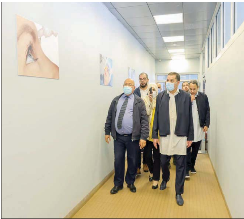
عبد الحميد الدببية رئيس الحكومة الليبية في جولة لتفقد عدد من مستشفيات طرابلس

وبحثت المنقوش بحسب بيان لوزارة الخارجية الليبية أمس، مسار العلاقات بين ليبيا ومملكة البحرين، وما تشهد من تطور ونمو، كما تمت مناقشة التطورات والمستجدات على الساحة الليبية، والجهود التي تبذل لتحقيق الأمن والاستقرار في ليبيا.