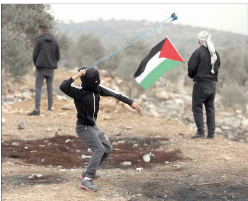
فلسطينيون خلال احتجاجات ضد المستوطنات في بلدة بيتا قرب نابلس بالضفة

في وقت نشرت فيه صحيفة «هارتس» العبرية، تحقيقاً مطولاً أثبتت فيه أن الجيش الإسرائيلي قتل 18 فلسطينياً من دون ذنب، خلال الستين الماضية، ولم يعاقب أبياً من الجنود على ذلك، أدانت منظمة التعاون الإسلامي بشدة الجرائم والإعدامات الميدانية التي تمارسها قوات الاحتلال بحق أبناء الشعب الفلسطيني، والتي كان آخرها الإعدام الميداني للطفل المقدسي عمر أبو عصب، و«تصعيداً خطيراً في وتيرة العنف الإسرائيلي والاعتداءات المستمرة على الشعب الفلسطيني». ووقعت أمس صدامات عنيفة في مناطق الضفة الغربية، أسفرت عن إصابة عشرات المواطنين، بالرصاص المطاطي.