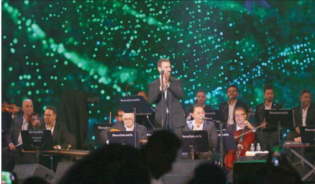
استمر الحفل حتى منتصف الليل بتشكيلة جمعت بين الكلمات الجميلة والموسيقى الرقيقة