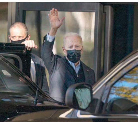
بايدن لدى وصوله إلى العيادة أمس

ومع ذلك، حظيت صحة بايدن باهتمام كبير بسبب تقدمه في السن وانخفاضات جمهوريين الذين استغلوا ما يزعمون أنه تدهور قدراته العقلية والبدنية. وخلال حملة