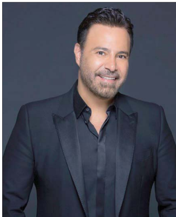
الفنان اللبناني عاصي الحلاني

- لقب «فارس الغناء العربي» هو اللقب المحب لي، وقد ارتبط اسمي به من سنوات طويلة واعتز وأفتخر بهذا اللقب الذي عرفني من خلاله الجمهور الكبير المحترم وأجمع عليه كل النقاد، ولذلك أنا أحب هذا اللقب لأنه يجمع بيني وبين الخيل وهي أهم هواياتي على الإطلاق، ولقب «فارس» فخر وشرف لي.