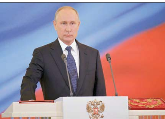
الرئيس بوتين خلال المصافحة على رئاسته في 2018

وفي سياق متصل، قال المتحدث باسم الكرملين دميتري بيسكوف: «كل مرة نظن أن ما من شيء أسخف ولا أكثر عداء ولا أقل وأد وإيجابية يمكن أن يأتي من ذلك الجانب من المحيط، وكل مرة نكون مخطئ مع الأسف».