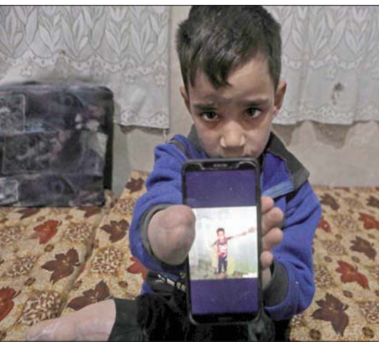
طفل سوري يعرض صورته أمس عندما كان في منزله شمال سوريا

ولا يزالون قيد الاختفاء القسري حتى اليوم (السبت)».