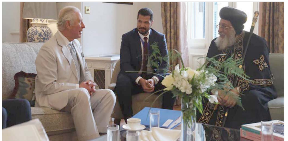
الأمير تشارلز لقاء البابا تواضروس الثاني

البيئية المصرية إلى أنه تم «وضع هدف طموح بأن تكون 50 في المائة من مشروعات الدولة المصرية خضراء بحلول عام 2024، و100 في المائة بحلول عام 2030، كما تم إطلاق الأمير تشارلز في الجلسة ركزت على مشروعات التصدي لآثار تغير المناخ، مثل مشروعات النقل والصرف الصحي»، لافتة إلى «العمل على توفير مشروعات مريحة في هذا الصدد مثل مشروعات الطاقة الجديد والمتجددة».