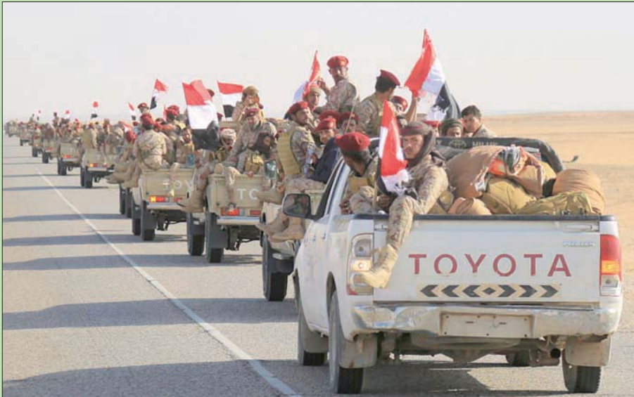
جانب من كتيبة إسناد للجيش اليمني وعملياته الدفاعية في مأرب

وأكد المتحدث الجيش اليمني أن القوات في جبهات بيحان وعسيلان بشبوة، نفذت هجوماً مضاداً على المواقع التي كانت تتمركز فيها الميليشيات الحوثية المتقدمة على الأرض وقضت على العشرات من عناصر الميليشيات في جبال بيحان وعسيلان، مؤكداً أن طيران التحالف ومدفعية الجيش تمكّنوا