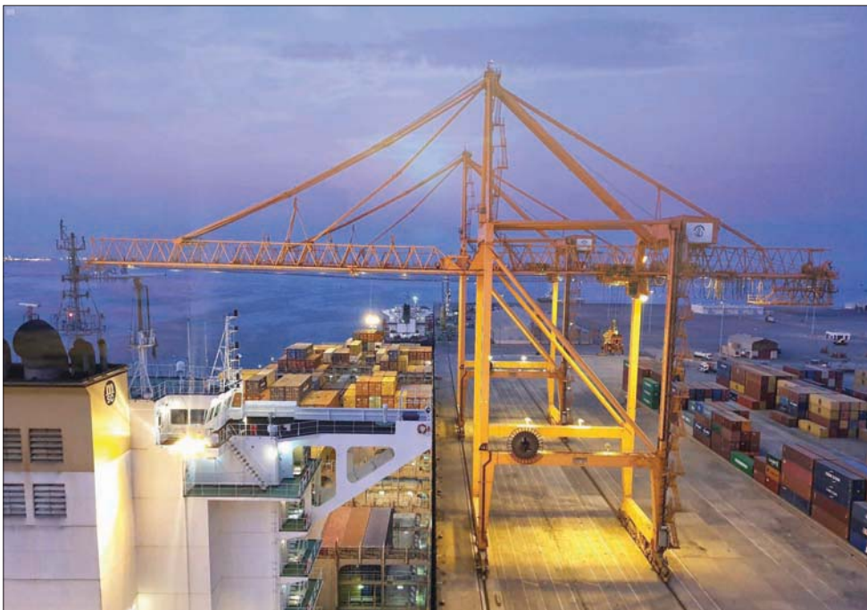
السعودية تفتح أبواب الفرص لنشوء قطاع عملاق في الخدمات اللوجستية (الشرق الأوسط)

ويعد قطاع الخدمات اللوجستية، فرصة للباحثين عن استثمارات متنوعة وديناميكية، وفقاً للفاصل، الذي قال إن السوق السعودية كبيرة في هذا الجانب، بحكم ما لديها من مقومات ومنها العدد الكبير من المطارات والموانئ، إضافة إلى الموقع الاستراتيجي للمملكة، والذي يجعلها هدفاً للمستثمرين لكونها مرمر للتجارة العالمية على الجانبين في البحر الأحمر والخليج العربي، الأمر الذي يسهل الوصول إلى الأسواق العالمية في آسيا، وأوروبا وكذلك الولايات المتحدة الأمريكية، لافتاً إلى أن سلسلة الإمداد تنمو بوتيرة متزايدة ما يعزز نمو حجم الاستثمار في الخدمات اللوجستية.