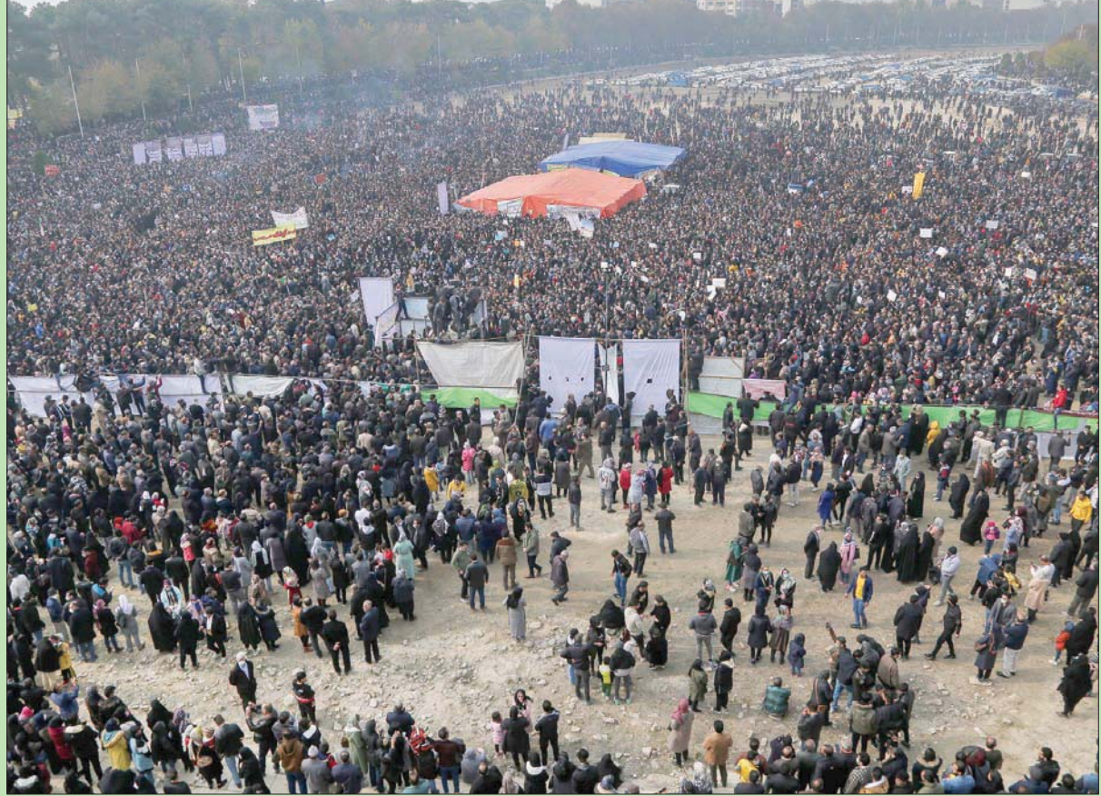
آلاف المزارعين يحتجون في مدينة أصفهان وسط إيران على نقص المياه أمس