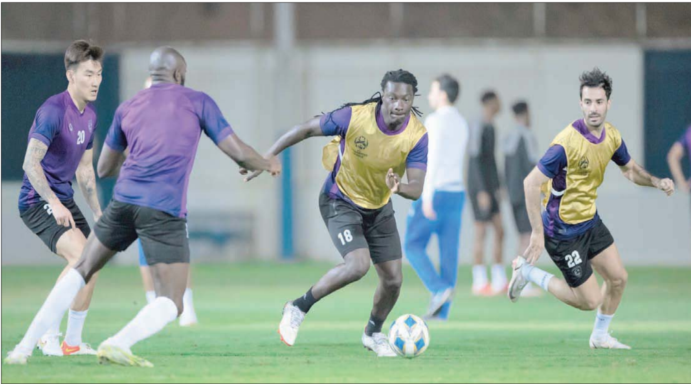
من تدريبات الهلال استعداداً للنهائي الآسيوي (الشرق الأوسط)