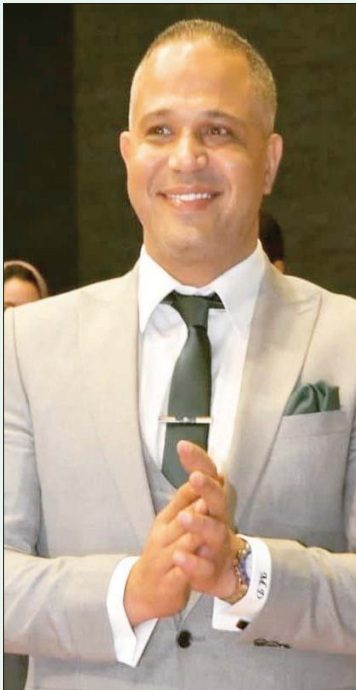
الفنان المصري مصطفى درويش

وعن الشخصيات التي يرغب في تقديمها مستقبلاً، يقول: «أمامي متسع من الوقت لأقدم ما يحلو لي وما يعرض علي، ويكون ملائماً لشخصيتي، لكنني مشغول حالياً بتقديم أدوار مميزة لتكون علامة مهمة في مشواري ورسيد فني أستند إليه».