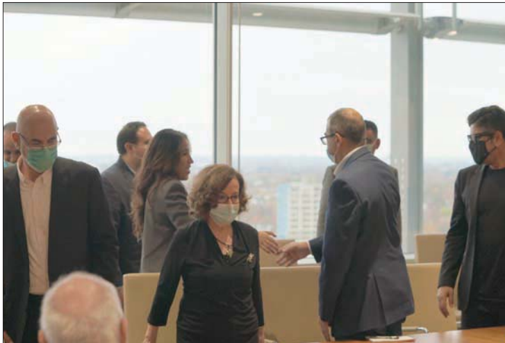
الرئيس التنفيذي لـ «المجموعة السعودية للأبحاث والإعلام» مع مجموعة من صحافيي «الشرق الأوسط»