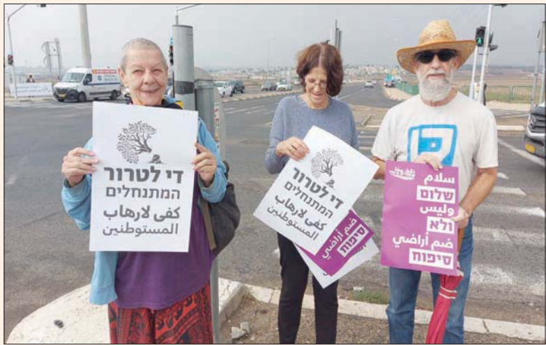
أنصار السلام من خلفيات مختلفة خلال حملة احتجاج على عنف المستوطنين

كما أوردت صحيفة «هارتس» على لسان سكرتير عام الجمعية الاستيطانية «أمنا»، أن هناك 150 بؤرة ومزرعة استيطانية تنتشر في أنحاء الضفة تسيطر على 200 ألف دونم، وهي ضعف مساحة الأرض المبنية للمستوطنات. ويشير تقرير «بتسيلم» إلى أن الاحتلال الإسرائيلي استولى على أكثر من مليوني دونم من أراضي الضفة الغربية لغرض الاستيطان، وأقام 280 مستوطنة يسكنها 440 ألف مستوطن، بينها 138 مستوطنة تعترف بها إسرائيل بشكل رسمي (لا تشمل 12 حيا استيطانياً أقمتها على أراض ضمتها في القدس) ونحو 150 بؤرة ومزرعة استيطانية لا تعترف بها حكومة إسرائيل بشكل رسمي، أقيم ثلثها في العقد الأخير، وتُصنف على أنها مزارع استيطانية. ويشمل مسار اعتداءات المستوطنين للاستيلاء على الأراضي الفلسطينية: حرق مساجد وأشجار زيتون، سرقة محاصيل التفخير سيارات، سرقة محاصيل المزرعات الفلسطينية، اعتداء على قاطني الزيتون ورعاية المواشي بواسطة الكلاب وقذف بالحجارة وإطلاق الرصاص الحي عليهم. وهذا فضلا عن الاعتداءات والأجانب. وإزاء الانتقادات للجيوش الإسرائيلية، واتهامه بالتهاون مع المستوطنين وتوفير الحماية لهم وتشجيعه لاعتداءاتهم، أعلن الناطق بلسانه، أمس الجمعة، أنه اصدر اوامره لقيادة وحدته العاملة في الضفة بالتدخل لمنع المستوطنين من تنفيذ هذه الاعتداءات.