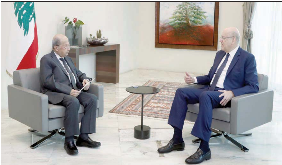
من اجتماع الرئيس عون ومبقتي أمس (الدالتي ونهرا)

الإلتقاء إلى صندوق النقد الدولي، وقد تستغرق المفاوضات معه وقتاً إضافياً يتعدى نهاية العام الحالي، ولكن من خلال صندوق النقد يحظى لبنان بما أسماه إشارة معينة لكل الدول بأن لبنان قابل للتعاقد ويجب دعمه»، وقال: «كل العالم لم يريد للبنان أن يسقط ومستعد لمساعدتنا، وعندما أقول العالم، فإننا أقصد أيضاً الدول العربية، وعلينا أن نقوم بالعمل المطلوب منّا أولاً». وتعهد مبقتي بأنه في بداية الشهر المقبل «ستبدأ عملية تسجيل العلاقات في مرحلة أولى يمكننا تأمين التمويل لـ 250 ألف عائلة وفق مبالغ مؤمنة من البنك الدولي بقيمة 245 مليون دولار، على أن تبدأ عملية الدفع نهاية العام الحالي أو بداية العام المقبل»، مضيفاً أن «عملية ستتم الكرتونياً حتى لا يقال إن الأموال تُدفع لأسباب انتخابية، علماً بأنني ووزير الشؤون الاجتماعية نتابعها بشكل مباشر»، وقال: «هناك أيضاً مساعدات مخصصة لـ 400 ألف عائلة تقبم في قرى ترفنق 700 متر عن سطح البحر، بمعدل 165 دولاراً لكل عائلة»، لافتاً إلى «أننا نُجري حالياً الإحصاءات المطلوبة، ووفق ذلك التعاون مع برنامج الأمم المتحدة للغذاء الذي سيخصص للبنانيين بدءاً من مطلع العام المقبل مبلغ 600 مليون دولار».