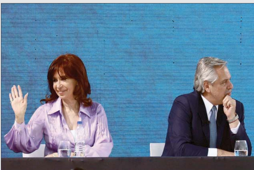
كريستينا كيرشنير تلوح لمناصريها

ونائبة، ويلعب هؤلاء دوراً أساسياً في تحديد قدرة رئيس الجمهورية على إدارة البلاد. كانت كريستينا كيرشنير قد فرضت على فرنانديز الاستعانة بتأييد الحكام عندما طالبته بتعيين خوان لويس منصور، حاكم محافظة توكومان، رئيساً للوزراء بعد الهزيمة في الانتخابات الأولية... وذلك بهدف تعزيز نفوذ الحركة في المناطق البعيدة عن العاصمة.