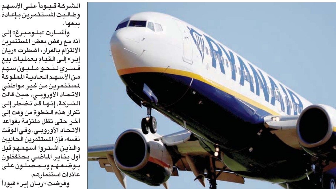
أصبحت «ريان إير» أول شركة كبرى تتحرك لغادرة بورصة لندن بسبب «بريكست» (رويترز)