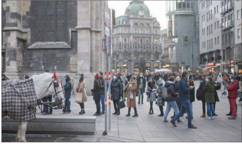
نمساويون يصطفون خارج مركز تلقيح في فيينا أمس

نصف الإصابات الجديدة في بعض البلدان الأوروبية يتفشى بين الأطفال دون الخامسة عشرة من العمر، فيما يزداد عدد المصابين الذين تلقوا الدورة الكاملة من اللقاحات، وفي بعض البلدان يتضاعف معدل انتشار الوباء كل أسبوع أو عشرة أيام ولا تجرؤ الأوساط العلمية على التنبؤ بمسار هذه الموجة أو بمواقيت بلوغها الذروة. وأمام هذا المشهد الذي لم تتردد المستشار الألمانية أنجيلا ميركل عندما وصفته بالكارثة، عادت خلية الأزمة الصحية في المفوضية الأوروبية إلى دورة الاجتماعات المتواصلة، فيما أعلن الناطق باسمها كريستيان ويغان عن «تقرب صدور توصية جديدة حول الغتقل داخل بلدان الاتحاد وتعديلات في صلاحية شهادات التلقيح المعترف بها في أوروبا». ومع اتساع دائرة التشكيك بفاعلية