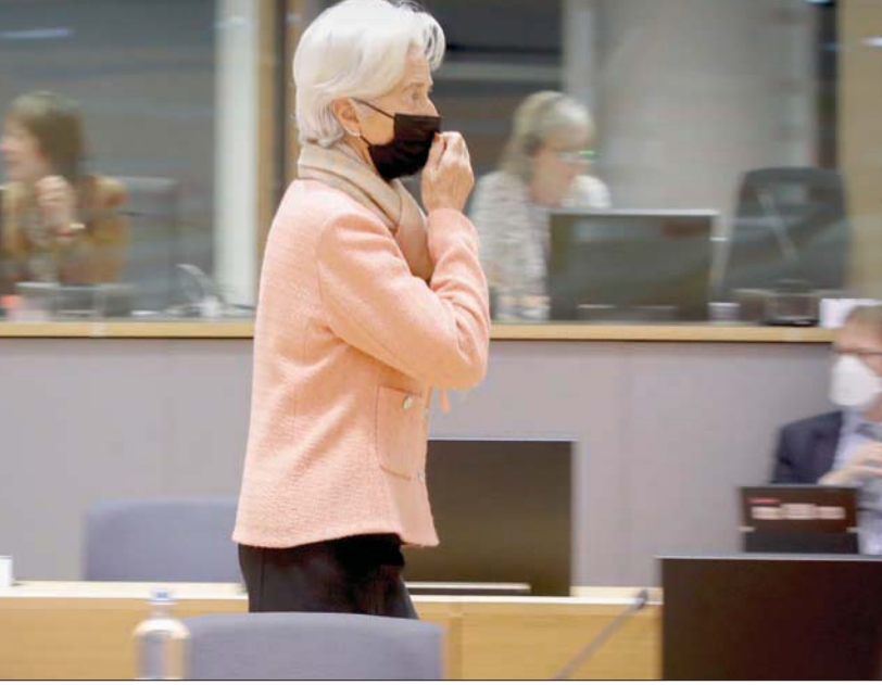
قالت كريستين لاغارد إنه لا يتعين على البنك المركزي الأوروبي تشديد السياسة النقدية قريباً رغم التضخم «المؤلم غير المرحب به»

عن مخاوفها بشأن تأثير ارتفاع أسعار الفائدة على المستهلكين، وقالت «في الوقت الذي تتعرض فيه القوة الشرائية لضغوط بالفعل بسبب ارتفاع فواتير الطاقة والوقود، فإن التشديد غير المبرر للسياسة النقدية سيأتي بأثر عكسي على الانتعاش الاقتصادي».