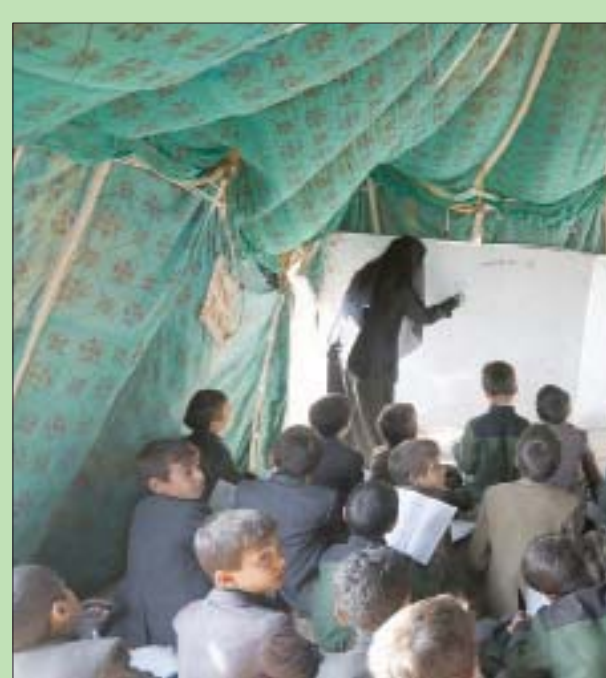
أحد الصفوف المكتظة بالتلاميذ في مدرسة داخل خيمة بضواحي صنعاء

في الشوارع، حيث لم يتلقوا رواتب منتظمة منذ عام 2016 وأن هناك أكثر من 2,2 مليون طفل الآن خارج المدرسة بعد سبع سنوات من الصراع، فيما يحتاج نحو 8 ملايين طفل إلى دعم تعليمي فقط لمواصلة التعلم الأساسي، كما نرح نحو 1,7 مليون طفل في المدارس والنقطوع عن الخدمات الأساسية. ونقل التقرير عن معلمة يمنية تقول: «كيف يتوقع أن يذهب المعلم إلى الفصل ويعلم الطلاب أثناء التفكير في طرق لإطعام أطفالهم؟ لا أملك الكثير منا حتى المال لدفع تكاليف المواصلات إلى المدرسة. وتضيف: «بالإضافة إلى التأثير النفسي الاجتماعي على المعلمين، دفعت الظروف المالية الحالية للمدرسين البعض إلى الذهاب إلى أعمال متواضعة أو العمل في الشارع. كيف تتوقع أن يحترم المعلم نفسه وأن يكون قادراً على الوقوف في الفصل أمام طلابه بعد رؤيته يعمل في الشارع؟ كيف تكون قدوة لطلابنا؟».