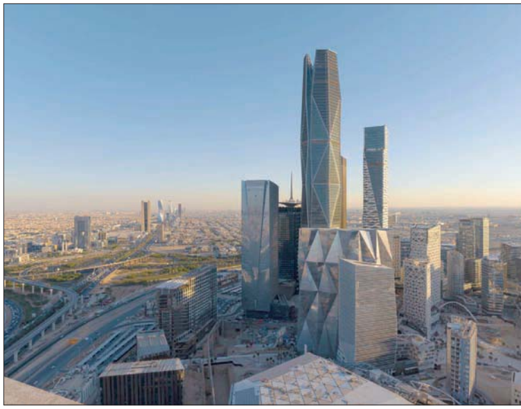
السعودية تفتح باب تجنيس الكفاءات دعماً لعجلة التنمية واستثمار العقول