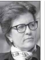
كارا سويشر *