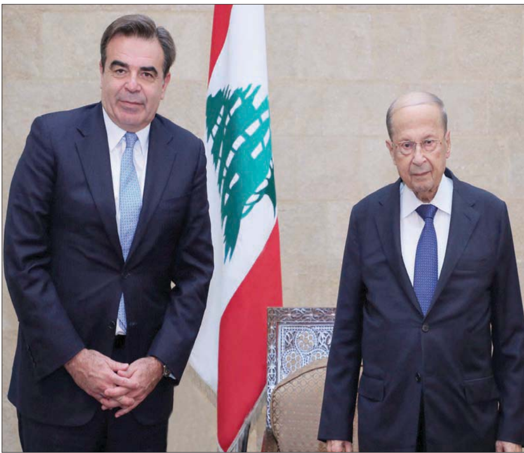
الرئيس ميشال عون مستقبلاً أمس نائب رئيسة المفوضية الأوروبية

زار نائب رئيسة المفوضية الأوروبية مارغرييتيس شيناس لبنان، أمس، في إطار جولة يقوم بها في المنطقة لمعالجة الوضع على الحدود بين بولندا وبيلاروسيا والهجرة غير الشرعية إلى أوروبا. وأعلن أنه طلب مساعدة لبنان على الحد من تسلسل المهاجرين، وكان تأكيداً للتعاون، بحسب ما أعلن في بيان له بعد لقائه رئيس الجمهورية ميشال عون ورئيس الحكومة نجيب ميقاتي.