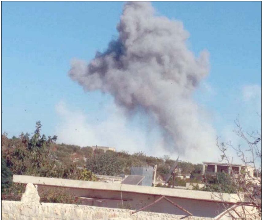
دخان يتصاعد من ريف إدلب بعد قصف أمس (الشرق الأوسط)

حملة قصف بقذائف المدفعية والصاروخية على مواقع تابعة للقوات النظام والمليشيات الإيرانية، في ريف إدلب الجنوبي والشرقي وريف حلب، رداً على 11 نوفمبر، التي استهدفت مناطق مدينة محيط مدينة إدلب، تؤوي نازحين وأسفرت عن مقتل 5 أشخاص، وتمكنت الفصائل من قتل 5 عناصر من قوات النظام وإصابة عدد آخر بجروح، فيما جرى تدمير دشمة لقوات النظام ومقتل قاصدها على جبهة بالا والضبعة غربي حلب، وأعقبت ذلك اشتباكات عنيفة بين الطرفين بالأسلحة الثقيلة وإدلب الجنوبي.