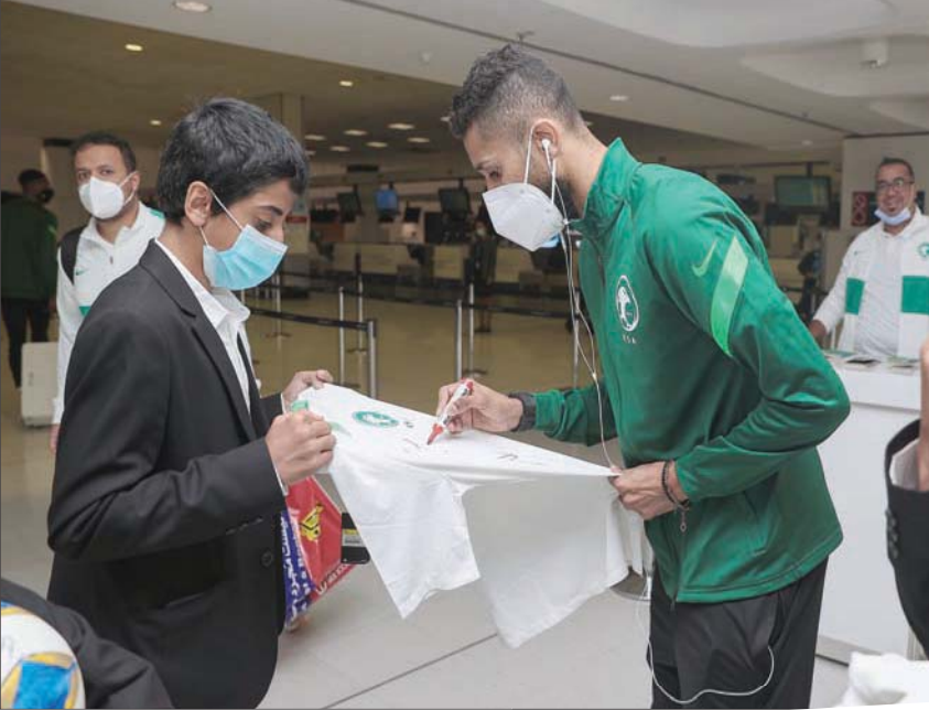
سلمان الفرج يوقع على قميص لأحد أفراد الجالية السعودية في فيتنام

ويعيش الأخضر السعودي تجانساً كبيراً تحت قيادة الفرنسي إيرفي رينارد الذي يقوده منذ أكثر من عامين، ويذكر أهمية نقاط مواجهة فيتنام مساء الثلاثاء المقبل، التي ستمنحه المزيد من الحظوظ في بلوغ المباراة لمونديال قطر 2022.