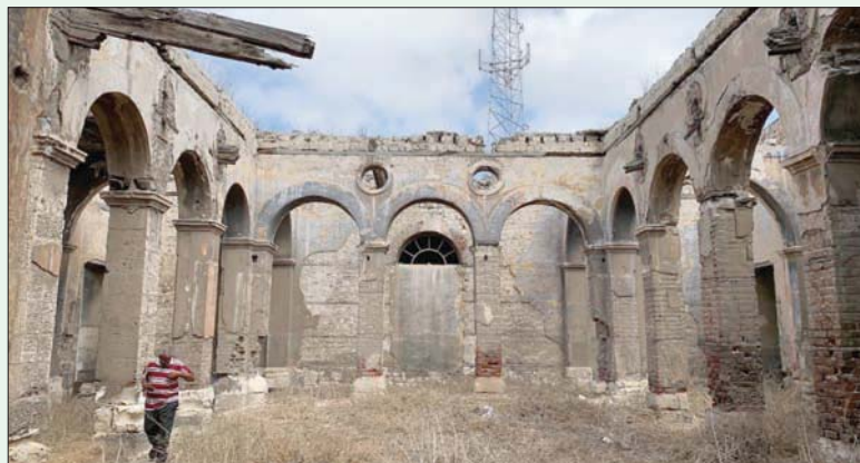
المبنى الرئيسي لمحطة القباري من الداخل قبل هدمها

ويؤكد مرسى «ما لفت نظري أن المبنى كان بحالة جيدة للغاية من الناحية المعمارية، رغم مرور السنوات الطويلة، ما يدل على دقة البناء، كما أن أسقفه الخشبية كانت قائمة وبحالة ممتازة وغير مشرخة أو مهدمة»، مشيراً إلى أن «محطة القباري تتشابه معمارياً مع (باب الحديد)، الاسم الأقدم لمحطة (سكك حديد مصر)، المعروفة باسم محطة مصر أو المحطة الرئيسية