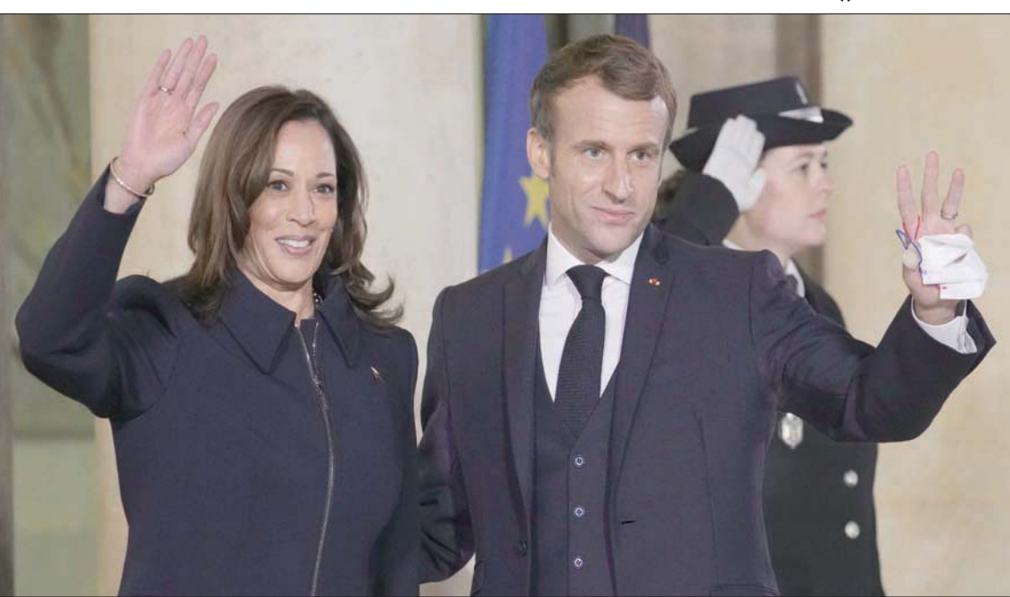
ماكرون مع هاريس «نجمة» المنتدى التي حظيت باهتمام فرنسي رسمي استثنائي

ما سبق يشكل غضباً كبيراً لما يدور في منتدى باريس للسلام وما يصعب حصره نظراً لتعدد «ورشات العمل»، وكثرة المتدخلين ووفرة المشاريع المطروحة والمختلطة بين الجانب الرسمي الحكومي وبين القطاع الخاص ومنظمات المجتمع المدني. وما يؤمل منه أن يخرج شيئاً عملياً، والا يبقى «مصنوعاً» للتبادل جمع لعديد من الموضوعات المتعلقة بالذكاء الصناعي، ولكن من دون إحداث تغييرات ميدانية.