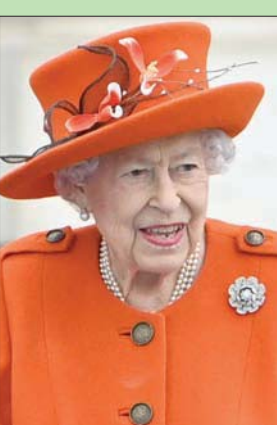
الملكة الثانية ستشارك في حفل «الذكرى»

لندن، «الشرق الأوسط» بعد أن اضطرت أخيراً لتقليل التزاماتها العامة بناء على نصيحة الأطباء، أعلن قصر باكنغهام أن ملكة بريطانيا إليزابيث الثانية ستشارك في حفل «الذكرى» يوم الأحد في لندن، لكنها تخلت عن حضور مناسبة أخرى، حسب وكالة الصحافة الفرنسية. وقال قصر باكنغهام، في بيان، إن الملكة التي عبرت عن «غبتها الحازمة» في ذلك قبل أسبوعين، ستحضر مراسم الأحد عند النصب التذكاري في لندن، 2013، لإجراء موضحاً أنها «ستحضر كما في السنوات السابقة» المراسم «من شرفة مبنى» وزارة الخارجية. وتابع البيان: «بناء على النصائح الأخيرة لأطبائها، قررت الملكة عدم حضور (السينودس) العام لكنيسة إنجلترا الذي ينعقد الثلاثاء 16 نوفمبر (تشرين الثاني)». وتمضي الملكة إليزابيث