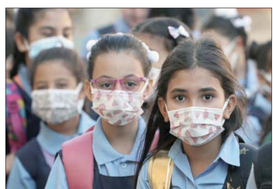
تلميذات يرتدين كمامات في مدرسة بالقاهرة الثلاثاء

بجميع محافظات المصرية، ومتابعة الموقف أولاً بأول بشأن فيروس (كورونا)، واتخاذ جميع الإجراءات الوقائية اللازمة ضد أي فيروسات أو أمراض معدية». وقال المتحدث «الصحة المصرية» خالد مجاهد، إن «الوزارة لم ترصد أي متحورات جديدة لـ«كورونا» في مصر». مضيفاً «نحن الآن في الموجة الرابعة من الفيروس؛ لكن مقارنة بالموجة الأخيرة تعتبر نسبة الإصابة أقل». ولفت مجاهد إلى أنه «يتم تطعيم أكثر من نصف مليون مواطن يومياً»، مضيفاً أن «هناك مجاهدة على مستوى