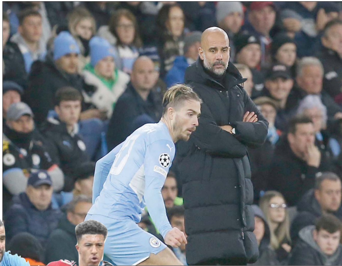
غريليش لم يزل ثقة غوارديولا الكاملة بعد