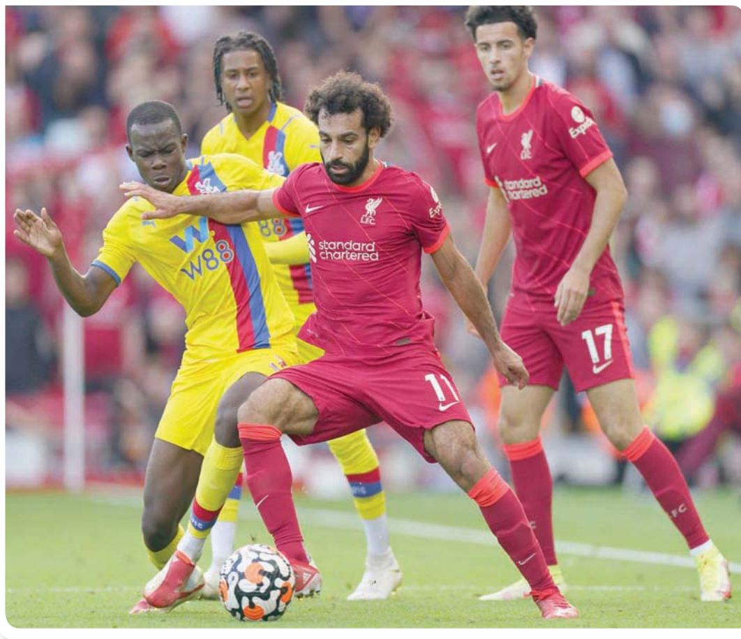
تيريك ميتشل في صراع على الكرة مع محمد صلاح

برينتفورد المثير للجدل بإغلاق أكاديميته للناشئين من أجل أحب كرة القدم منذ نعومة أظفاري، لكن عندما تكون أصغر سناً يكون من الصعب عليك استيعاب وفهم الجانب الاحترافي للعبة بالكامل، مثل الالتزام بالمواعيد وأشياء أخرى من هذا القبيل. الأمر يختلف تماماً عن مجرد الخروج وركل الكرة مع أصدقائك. ومع ذلك، فحين قرار