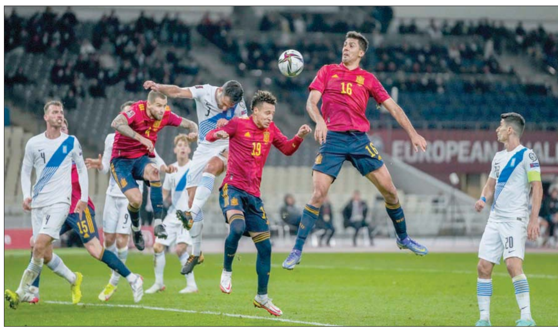
إحدى الفرص الضائعة من المنتخب الإسباني

من مدربه هانزي فليك على خلفية الإصابات وفيروس كورونا الذي حرم المنتخب من العديد من نجومه. وبعد 8 دقائق من صافرة البداية طر الحكم بالبطاقة الحمراء جن هوفر بعد لعبة «كارايتيه» على حلق ليون غوريتسكا، واحتسب ركلة جزاء ترجمها إيلكاي غوندوغان بنجاح. «قتل» أبطال العالم أربع مرات المباراة في 4 دقائق مع ثلاثة أهداف تناوب عليها دانيال كوفمان عبر النيران الصديقة ولوروا سانيه وماركو رويس. وأضاف سانيه الهدف الثاني الشخصي له والخامس لفريقه في الدقيقة 49 من الشوط الثاني، قبل أن يسجل توماس مولر الهدفين السادس والثامن، فيما جاء الهدف السابع عبر ريدلي باكو، ليختتم المهاجم الهولندي عبر النيران الصديقة من ماكسيميليان غوبل وحطم فليك بفوزه السادس على التوالي منذ تسلمه مهامه الفنية الرقعة القياسي لاضل بداية مدرب الماني بحوذة سلفه يواكيم لوف مع 4 انتصارات على التوالي. وفي لحظة تاريخية أخرى في فولفسبورغ، أدارت الحكمة الكرواتية إيفانغا مارتينيسيتش للمرة الأولى مباراة دولية للرجال، والأولى أيضاً للمناشئات. وفي مباراتين أخريين فازت مقدونيا على أرمينيا 5 - صفر، فيما تعادلت رومانيا سلباً مع أيسلندا.