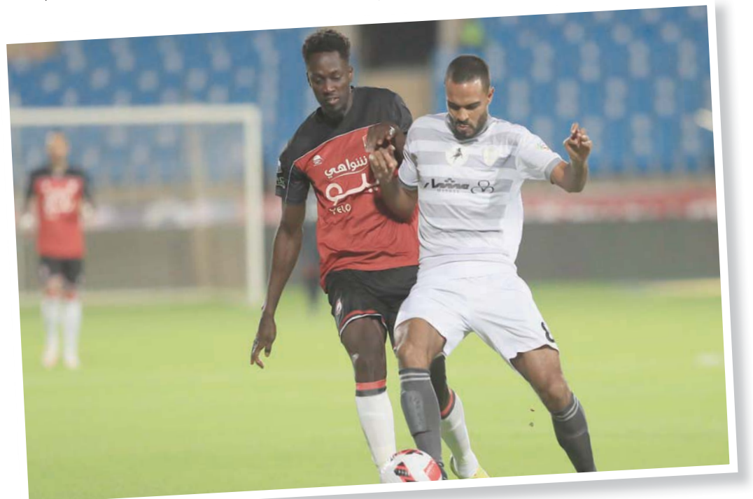
الطائي تلقى خسارة ثقيلة على يد الرائد في آخر مواجهاته الدورية

ويقدم التدريبات حالياً، التونسي كريم السباعي الذي كان ضمن الطاقم المساعد للمدرب السابق زوران حيث وضع برنامجاً إعدادياً مكثفاً خلال فترة التوقف الحالية لبطولة الدوري تتضمن مواجهة قوية ضد الهلال يوم الاثنين المقبل قبل عودة الفريق للمباريات