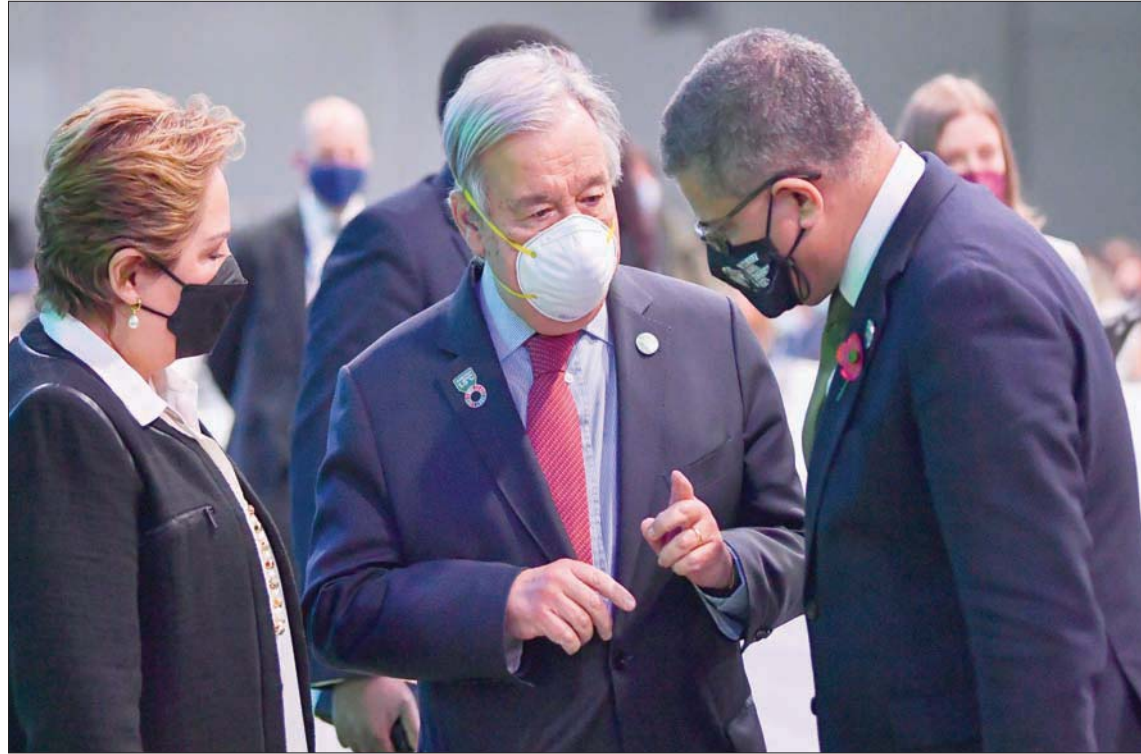
أولك شارما وأنطونيو غوتيريش وباتريشيا إسبينوزا خلال حديث على هامش ختام أعمال «كوب 26» في غلاسكو أمس

وفي صلب هذه المسألة الحاسمة، الوعد التي تف بها الدول الغنية بزيادة مساعداتها الخاصة بالمناخ لدول الجنوب إلى 100 مليار دولار سنوياً ابتداء من عام 2020 للتصدي لظاهرة الاحتباس. كما تدين بعض دول الجنوب ما يطالب به العالم المتقدم المسؤول عن ظاهرة الاحتباس الحراري، الدول النامية. وقال البوليافي ديغو باتشيكو باسم مجموعة LMDC التي تمثل البلدان النامية والناشطة ومنها الصين: «لا نتحمل المسؤولية نفسها، عليهم أخذ المبادرة والقيام بواجباتهم» للتصدي للاحتباس الحراري. وسلط كل هذه العقبات على طريق نجاح مؤتمر الأطراف الحاسم في محاولة لإبقاء هدف 1,5+ درجة مئوية، وساهم إعلان الولايات المتحدة والصين المفاجئ الأربعاء عن اتفاق لتعزيز تحركهما لصالح المناخ في إعطاء بصيص أمل. وصرح نائب رئيس المفوضية الأوروبية فرانس تيمرمانز لوكالة الصحافة الفرنسية بأن ذلك «يساهم في إشاعة جو أفضل»، وتدارك «الكن لا يزال آمناً كثير من العمل».