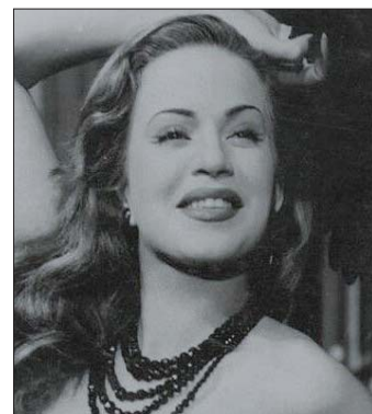
الفنانة الراحلة هند رستم

دور البطولة في أكثر من ثمانين فيلماً. ولطالما لعبت دور نساء قويات أصبحن رمزاً جريئاً للقوة النسائية والاستقلال