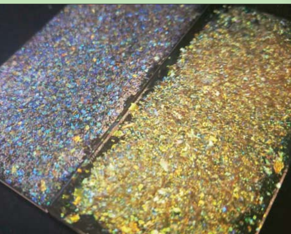
مادة «غليتر» البراقة لإضفاء المزيد من المعان

طن من الجسيمات البلاستيكية كل عام في أوروبا وحدها، وميزة هذا الابتكار المستدام هو يعتبر أنه المرة الأولى التي أمكن فيها إنتاج هذه المواد على نطاق صناعي. وباستخدام تقنية «بكرة - إلى - بكرة» ماثلة لتلك المستخدمة في صنع الورق من لب الخشب، فقد تمكن الباحثين من إنتاج صفائح كبيرة يمكن بعد ذلك طحنها إلى جزيئات بحجم «غليتر» لكنه صديق للبيئة.