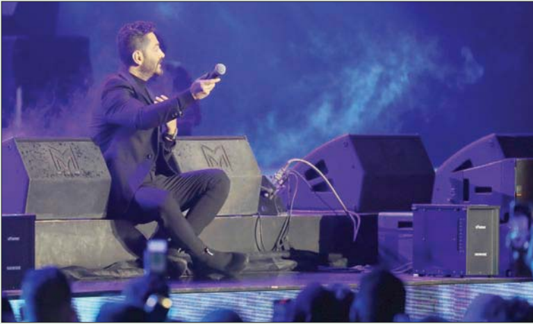
تامر حسني خلال الحفل في مسرح أبو بكر سالم

«حركة كرت» الأردنية، قدمت خلالها وصلات غنائية مزجت فيها بين الموسيقى الشرقية والغربية.