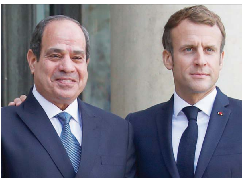
الرئيس السيسي خلال لقائه الرئيس ماكرون في الإليزيه أمس

التي تواجههما على ضفتي المتوسط». وأوضح المتحدث الرئاسي المصري أن «رئيس المجلس الأوروبي حرص على الإشادة بجهود مصر في مجال مكافحة الهجرة غير المشروعة»، مؤكداً «اهتمام الجانب الأوروبي لهذا