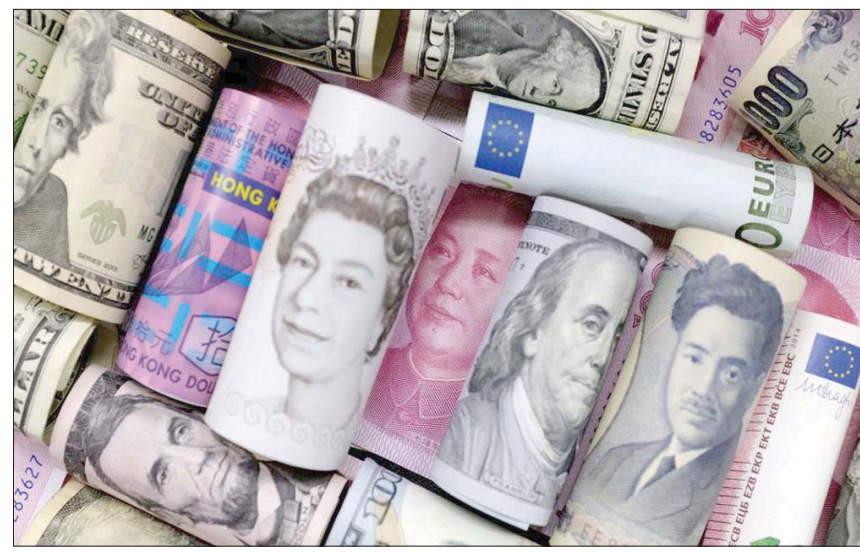
بلغت الديون السيادية المستحقة على أشد البلدان فقراً مستويات مرتفعة بشكل خطير (رويترز)