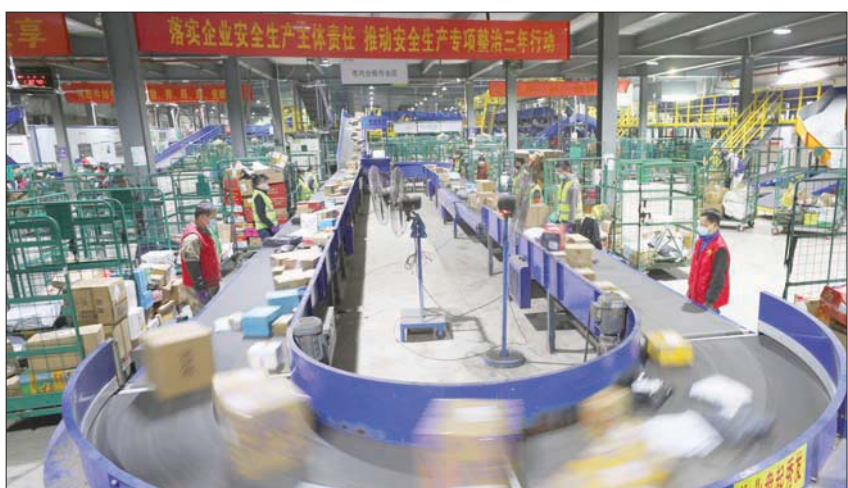
أعلنت «علي بابا» رقماً قياسياً جديداً في مبيعاتها في «يوم العزّاب» بنحو 84,5 مليار دولار