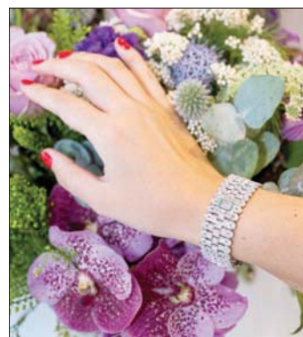
بيعت هذه الإسورة بضعف السعر التقديري (دار سوديز)

واشتهرت رستم بشغفها بجمع المجوهرات واقتناء القطع الثمينة من مختلف أنحاء العالم من خلال معرض المجوهرات المفضل لديها في القاهرة بالإضافة إلى تصميم عدد من القطع المميزة. كانت رستم أيضاً من الحاضرات المنتظمت في المزادات، حيث كانت تبحث عن الأحجار الكريمة المفضلة لديها -الماس والياقوت- وسط عدد من التحف المتحققة.