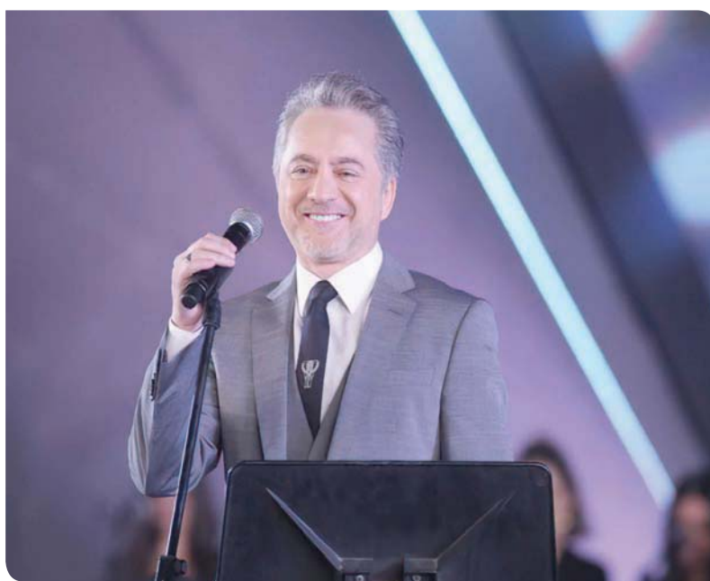
من حفل خوري الغنائي بمهرجان الموسيقى العربية المقام بدار الأوبرا المصرية

الأغنية من الحساني وغناء الفنانة الكبيرة ماجدة الرومي، وبالغفل اعتدت تقديمها أولاً، ولكن هذه المرة أحببت أن أقدم أغنية الفنانة عفاف راضي