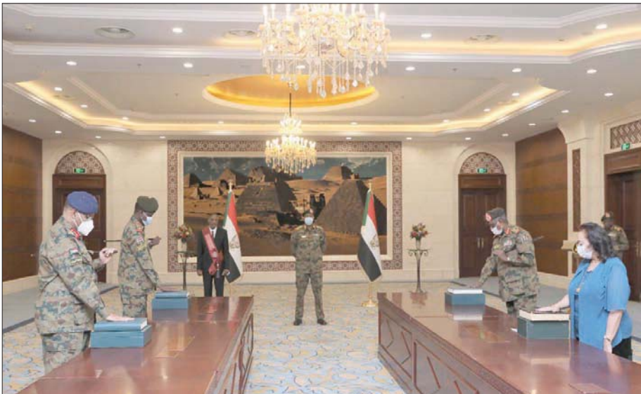
مراسم أداء القسم لبعض أعضاء مجلس السيادة الانتقالي الجديد في القصر الجمهوري أمس (سونا)

هذا الانقلاب». وأعلن هارون أن رئيس الجبهة الثورية، الذي يترأس حركة «جيش تحرير السودان» (المجلس الانتقالي الهادي إدريس، «ليس له ولا تنظيمه على ذلك» لا يعينهم في شيء وغير ملتزمين به... يرفضونه رفضاً قاطعاً».