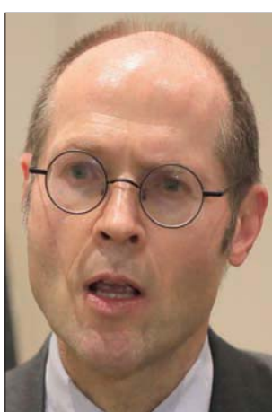
أوليفييه دي شوتر

وجه مسؤول أممي رفيع انتقادات حادة للسلطات اللبنانية، محذراً في ختام زيارته إلى لبنان من أن «صير مجتمع المانحين بدأ ينفذ مع الحكومة اللبنانية». واتهم المسؤولين اللبنانيين بأنهم يخذلون شعبهم وليس لديهم أي شعور بالمسؤولية. وقال مقرر الأمم المتحدة الخاص المعني بالفقر المدقع وحقوق الإنسان أوليفييه دي شوتر، في بيان، في نهاية زيارته إلى لبنان، حيث التقى مسؤولين وتقدم عدداً من المناطق في الشمال والبقاع، أن الدولة في لبنان أصبحت «على شفير الانهيار»، معتبراً أن الحكومة «تخذل شعبها»، وسائلاً: «علام أنفق القادة السياسيون الموارد؟» ولفت البيان إلى أن ما قامت به السلطات اللبنانية من تدمير للعلبة الوطنية، وإدخال البلد في مازق سياسي، وتعميق أوجه عدم المساواة التي طال