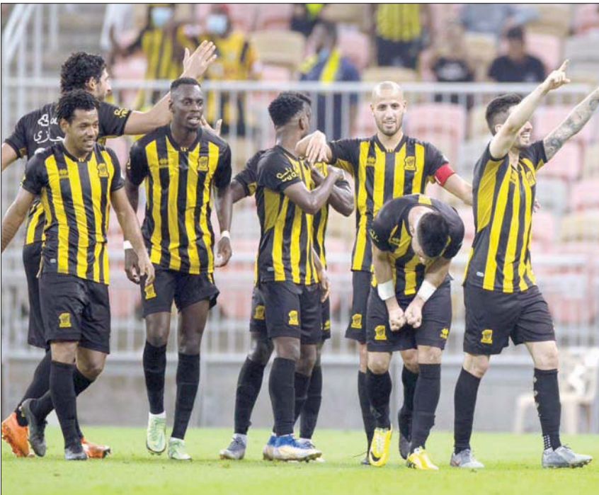
الاتحاد حافظ على صدارته للدوري بفوزه الأخير على الفتح

للمونديال، للعمل على زيادة المخزون المالي للاعبين، وكذلك تطبيق كثير من الجمل التكتيكية لعودة قوية للفريق مع استئناف المنافسات الرياضية ومواصلة الحفاظ على جادة الانتصارات التي كان آخرها الفوز على الفتح بثلاثية نظيفة في الجولة الماضية للدوري. ويستهل الاتحاد عودة المباريات مجدداً بقاء فريق الطائي في 27 نوفمبر (تشرين الثاني) الجاري، ضمن منافسات الجولة 13 للدوري السعودي للمحترفين، في الوقت الذي يعتلي فيه الفريق الاتحادي صدارة ترتيب فرق الدوري برصيد 23 نقطة، حققها 7 انتصارات وتعادلين وتعرض لخسارتين.