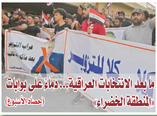
ما بعد الانتخابات العراقية... دماء على بوابات المنطقة الخضراء (حصاء الأسبوع)