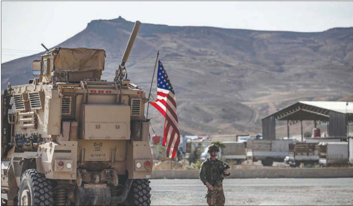
جندي أميركي يراقب الوضع في منطقة بشمال شرقي سوريا قرب معبر سيمالكا الحدودي مع العراق في بداية الشهر