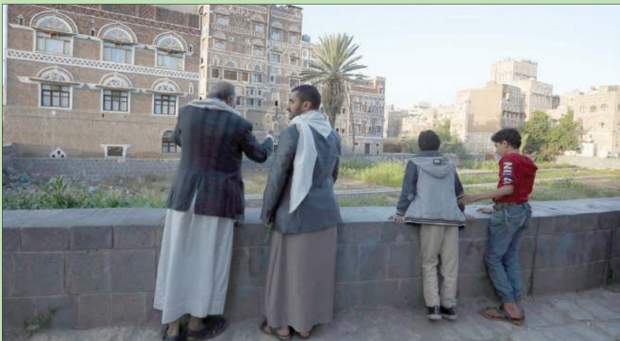
يمنيون أمام أحد مباني صنعاء التاريخية

محافظتي الضالع وإب حملات دهم واعتقالات وإغلاق للمحال التجارية، تحت مبرر البحث عن الطبعة الجديدة من العملة، التي حظرت الميليشيات تداولها في مناطق سيطرتها. ونتيجة لتلك التعسفات اضطر حينها التجار ومالكو المحال إلى الإغلاق احتجاجاً على تلك الممارسات ونهب الميليشيات الأموال، التي تقوم فيما بعد ببيعها للمالين لها يقومون بنقلها إلى مناطق سيطرة الحكومة. وتسببت هذه الممارسات الانقلابية في أزمة سيولة؛ لأن تعاملات هذه المناطق تتم مع مناطق سيطرة الشرعية، وليس مع مناطق سيطرة الميليشيات الحوثي؛ إذ يشتري التجار بضائعهم من هناك، كما أن الموظفين الحكوميين يتسلمون رواتبهم من الحكومة الشرعية.