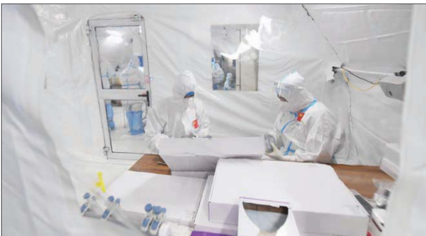
مختبر متنقل لفحص المصابين بـ«كورونا» في مدينة لانجو الصينية الشهر الماضي

علم الأحياء الدقيقة والمناعة، مدير علم الأحياء الهوائية للأمراض المعدية في مركز تولين القومي لأبحاث الرئيسيات، أن «العامل الأكثر أهمية في تحديد شدة المرض هو نقاط الضعف الفردية في الشخص المصاب».