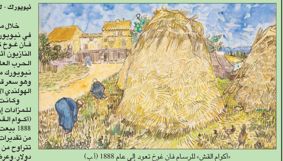
«أكوام القش» للرسام فان غوخ تعود إلى عام 1888

نيويورك - لندن، «الشرق الأوسط» خلال مزاد أقامته دار «كريستيز» في نيويورك، بيعت لوحة لفان غوخ كان قد استولى عليها النازيون أثناء احتلالهم لفرنسا في الحرب العالمية الثانية في مزاد في نيويورك مقابل 35,9 مليون دولار، وهو سعر قياسي للوحة ماثية للفنان الهولندي الانطباعي، حسب رويترز. وكانت قد قالت دار كريستيز للمزادات إن لوحة «مويل دو بلي» (أكوام القش) التي تعود إلى عام 1888 بيعت مقابل سعر أعلى بكثير من تقديرات ما قبل المزاد والتي كانت تتراوح من 20 مليوناً إلى 30 مليون دولار. وعرضت اللوحة أمام الجمهور