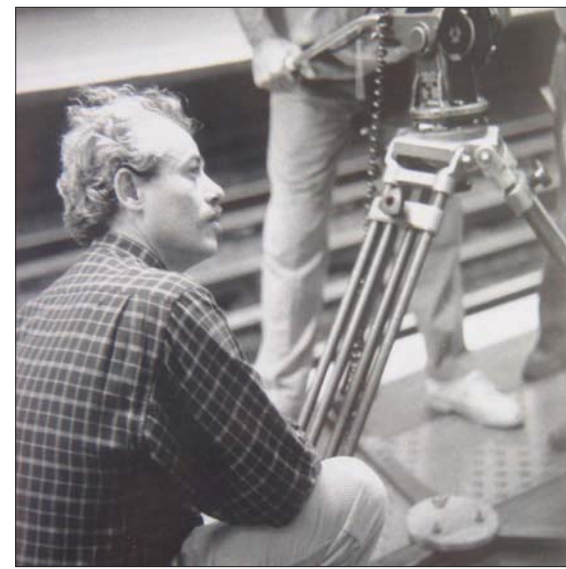
يكرم المهرجان المخرجة اللبنانية برهان علوية