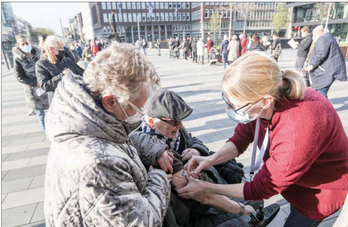
مسنٌ يحصل على الجرعة المعززة من لقاح «كورونا» في دويسبورغ بألمانيا