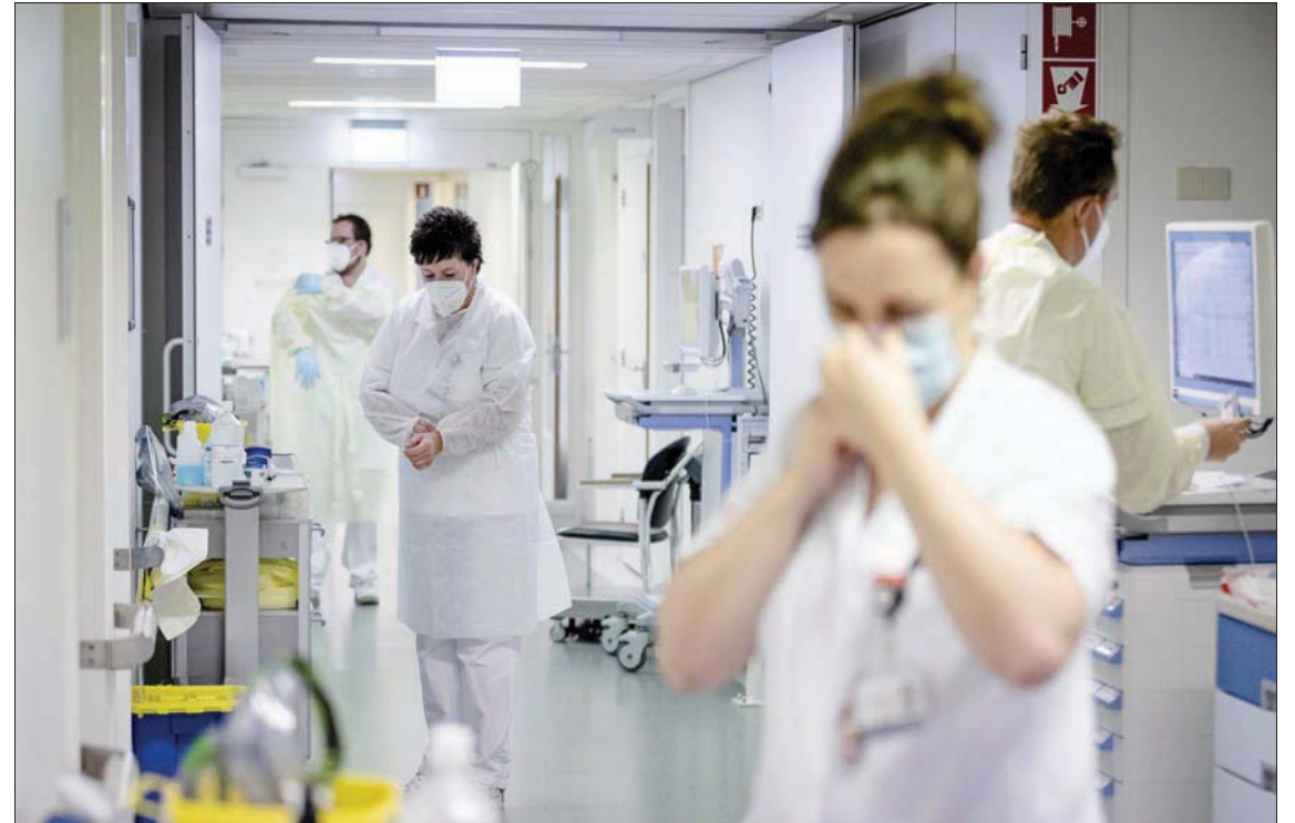
أعضاء طاقم طبي قبل دخولهم القسم الخاص بمرضى «كورونا» في مصحة باماستريخت الخميس (إ.ب.أ)

وحتى المدارس والمسارح ودور السينما مفتوحة. وزادت الإصابات الجديدة بفيروس كورونا بشكل سريع في 17,5 مليون نسمة بعد رفع إجراءات التباعد الاجتماعي في أواخر سبتمبر (أيلول)، ووصلت إلى مستوى قياسي بلغ نحو 16300 إصابة، الخميس. أما النمسا، فتعتمد فرض إغلاق على مستوى البلاد أمام غير الملقحين. وأعلن المستشار النمساوي الكسندر شالنبيرغ أنه سيجري فرض إغلاق على الأشخاص الذين لم يتلقوا لقاح كورونا، في إطار إجراءات مكافحة الجائحة. وقال شالنبيرغ الجمعة إن القرارات ذات الصلة ستتخذ يوم الأحد المقبل، في ضوء الزيادة الحادة في عدد الإصابات بـ«كورونا».