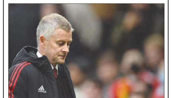
سولسكاير لم يقدم الصورة المجهدة ليوناييت