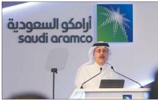
الرئيس التنفيذي لشركة «أرامكو السعودية» أمين الناصر

لندن، «الشرق الأوسط» قال الرئيس التنفيذي لشركة «أرامكو السعودية» أمين الناصر، أمس (الثلاثاء)، إن الطاقة الإنتاجية الفائضة للنفط على مستوى العالم يمكن أن تقلص العام المقبل مع عودة السفر بالطائرات وهو ما ينهي عنصر أمان مهم تتمتع به السوق في الوقت الراهن. وقال الناصر لمندى «بنكي غلوبال مانجمنت»: «الطاقة الإنتاجية غير المستغلة التي تبلغ حالياً 3 - 4 ملايين برميل يوميا تتيح بعض الارتياح للسوق، ومع ذلك أخشى أن