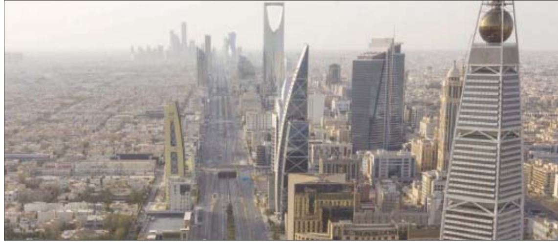
الاقتصاد السعودي يظهر تعافياً جلياً بأعلى نمو للناتج المحلي منذ 9 أعوام

وبحسب بن جمعة، نمو اقتصاد النفط بمعدل 9 في المائة يعد إنجازاً كبيراً بحسب لجهود الأمير عبد العزيز بن سلمان وزير الطاقة السعودي، مؤكداً أن استمرار إنتاج المملكة عند أسعار مرتفعة يحقق المزيد من النمو ومساهمة أكبر في الناتج المحلي الإجمالي. من جانبه، أوضح الخبير الاقتصادي عبد الرحمن الجبيري لـ «الشرق الأوسط» وفرت الدعم الكامل لجميع القطاعات وتعمل وفق بيئة تتناسب مع تطورات الدولة في المرحلة الحالية وتحقق مستهدفات (رؤية المملكة 2030)، مشيراً إلى أن القطاع الخاص يعيش ازدهاراً نتيجة القرارات الحكومية الصادرة مؤخراً التي من شأنها أن ترفع من مساهمة القطاع في الناتج المحلي الإجمالي. وذكر عبد الرحمن الجبيري أن المملكة تمكنت من تجاوز أزمة كورونا التي ألتظت ظلها على اقتصادات دول العالم، ولكن بفضل حزم المبادرات السعودية التي استبقت الأحداث استطاعت