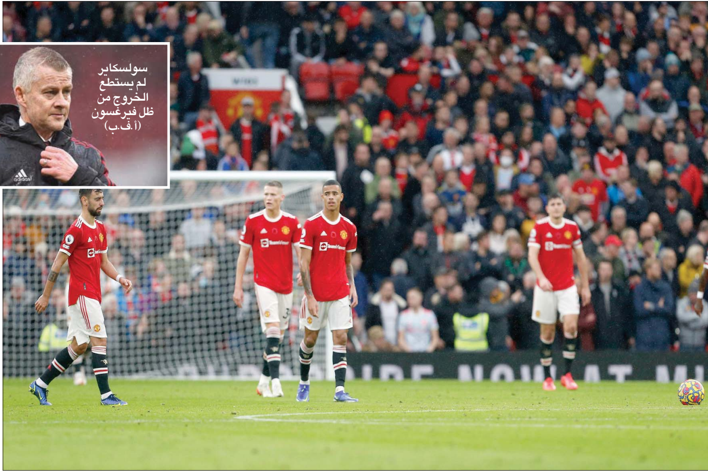
لاعبو يونائيد في حالة يأس عقب الخسارة أمام الجار مانشستر سيتي

يحاول إعادة إحياء فيرغسون ولو بشكل مختلف، فسولسكاير يحاول إعادة الروح التي كان يتمتع بها الفريق تحت قيادة فيرغسون، وجوزيه مورينيو كان يحاول إعادة البرغماتية والتركيز الشديد على حصد البطولات والألقاب، ولويس فان