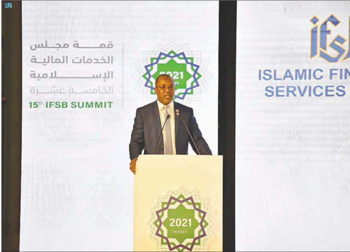
جانب من الجلسة التمهيدية لقمة مجلس الخدمات المالية الإسلامية التي تنطلق اليوم في جدة

كشف الأمين العام لمجلس الخدمات المالية الإسلامية الدكتور بيلو لاوال دانباتا، عن أن سوق الخدمات المالية الإسلامية في الدول الأعضاء حقق نمواً بشكل عام قُدِّر بنحو 44 تريليون دولار خلال السنوات الماضية، معتمداً في ذلك على الأصول المالية الإسلامية التي لعبت دوراً مهماً في السوق، في حين بلغ النمو في عام 2020 أكثر من 2,70 تريليون دولار.