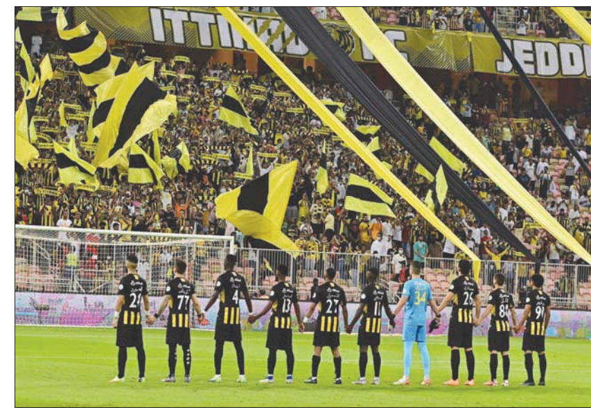
جماهير الاتحاد تصدرت لائحة ترتيب الأكثر حضوراً في الدوري السعودي

الرسمية قبل فتح الملاعب بالكامل في منتصف أكتوبر من عام 2021، ما جعل نسبة الحضور داخل الملعب تصل إلى 87,7 في المائة وحصلت إدارة الاتحاد على 750 ألف ريال على نسبة حضور أكبر من 75 في المائة من سعة الملعب. وحضر أيضاً 19558 مشجراً خلال كلاسيكو الاتحاد والشباب على ملعب الفيصل، ضمن الجولة التاسعة بنسبة حضور تصل إلى 72,4 في المائة من سعة الملعب الذي أصبح يسمح بدخول نحو 27 ألف مشجرح بعد قرار وزارة