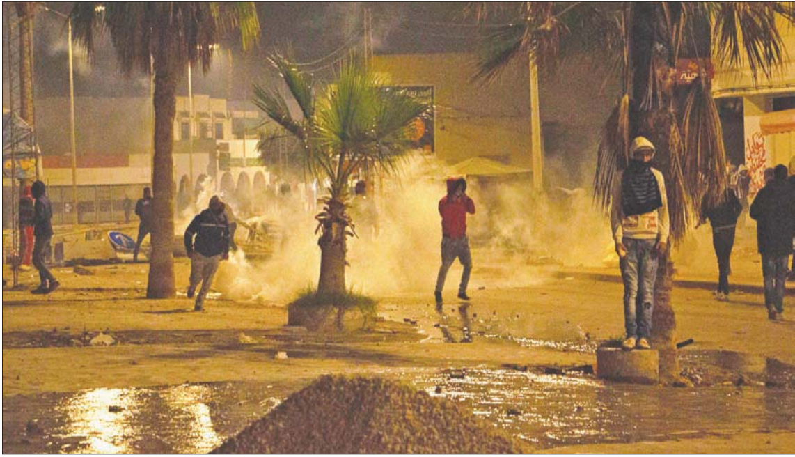
جانب من الاحتجاجات العنيفة التي شهدتها شوارع صفاقس ليلة أول من أمس

مؤامرات... «نظرية المؤامرة»... و«اتحاد الشغل» يرد بإعلان إضراب عام اليوم