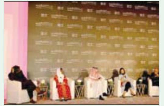
جانب من المؤتمر الصحافي لمهرجان البحر الأحمر السينمائي