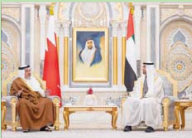
الشيخ محمد بن زايد والأمير سلمان بن حمد خلال لقائهما أمس في العاصمة الإماراتية أبوظبي