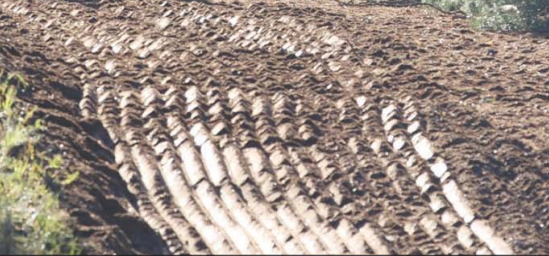
جنود من بيلاروسيا (يسار) يراقبون مهاجرين على حدود بلادهم مع بولندا أمس

ورداً على تدفق المهاجرين، حشدت بولندا آلاف الجنود على الحدود وأقامت سياجاً وأعلنت حالة الطوارئ، وحظرت على الصحفيين العمل في المنطقة. من جانبها، حذرت بيلاروسيا، بولندا، من القيام بـ«استفزازات» على الحدود