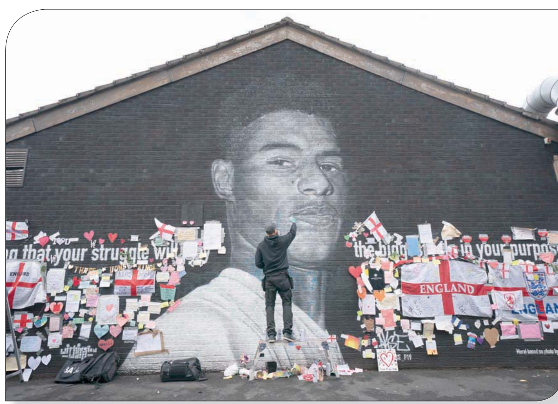
جدارية راشفورد في مانشستر أصبحت صرحاً لرفض التمييز والعنصرية

إن انحناء اللاعبين قبل هذا البلد، وسيظل هذا الانقسام