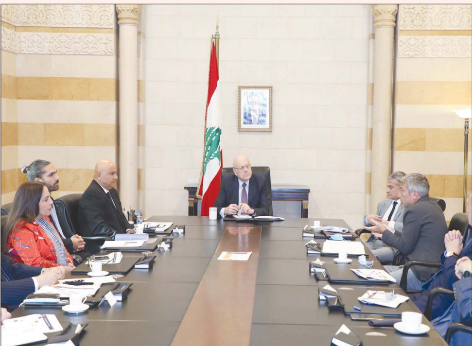
ميقاتي خلال ترؤسه اجتماع الحكومة اللبنانية المصغر أمس (اللائي ونهرا)