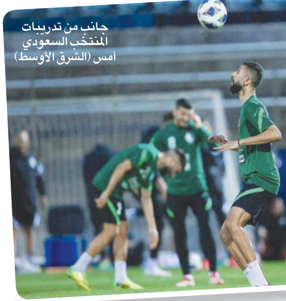
جانب من تدريبات المنتخب السعودي

وفي حين يلتقي ثنائي المقدمة في سيدني، ستلعب اليابان مع منافستها فيتنام متذلة المجموعة في هانوي، وستقابل عمان مع الصين المتعززة في الشارقة. وإذا حقق منتخب السعودية الانتصار الخامس مع فوز اليابان و عمان، سيوسع فريق المدرب رينارد للفارق في الصدارة، وسيستغل الصراع على المركز الثاني في المجموعة لكن في حال فوز أستراليا صاحبة الضيافة، سيعاود منتخب السعودية القتال، ويتاهل أول فريقين من المجموعتين مباشرة إلى نهائيات قطر 2022، في حين يلتقي صاحب المركز الثالث في ملحق آسيوي من أجل تحديد الفريق الذي سيخوض الملحق العالمي.