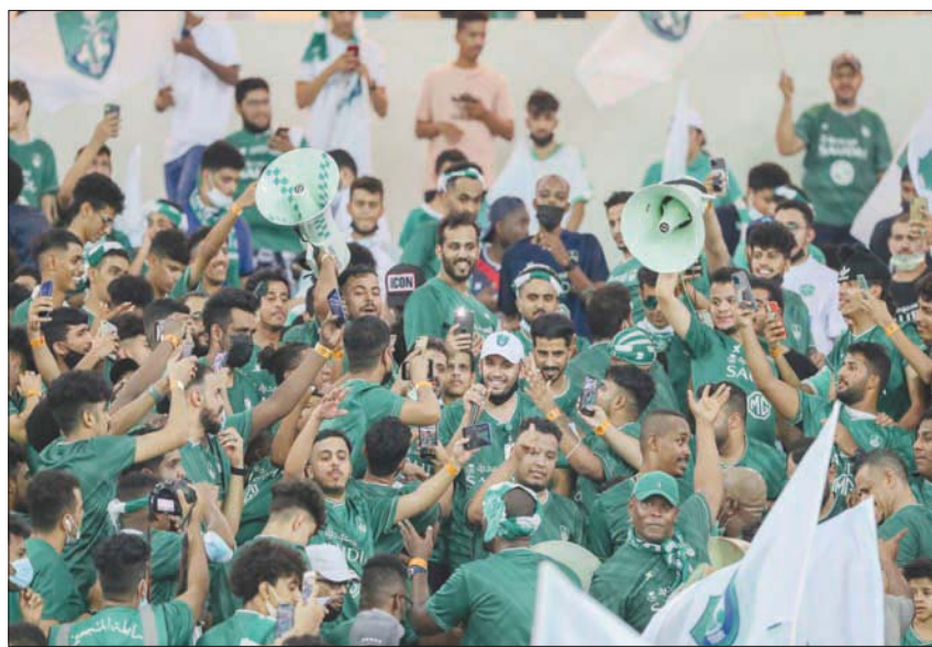
جمهور الأهلي كان حاضراً بقوة رغم المستويات السيئة للفريق في بداية الدوري

المحترفين السعودي هذا الموسم بين جميع الفرق بمتوسط وصل إلى 28008 مشجع في المباراة الواحدة، وهو متوسط الحضور الأعلى للنادي في آخر 6 سنوات على الأقل، حيث بلغ متوسط الحضور الجماهيري للفريق في موسم 2018 - 2019 نحو 24342 مشجراً، وفي موسم 2017 - 2018 نحو 16212 مشجراً في المباراة الواحدة، و 22728 مشجراً في موسم 2015 - 2016، بينما كانت أعلى نسبة خلال موسم 15/14 بنحو 42371 مشجراً في المباراة الواحدة.