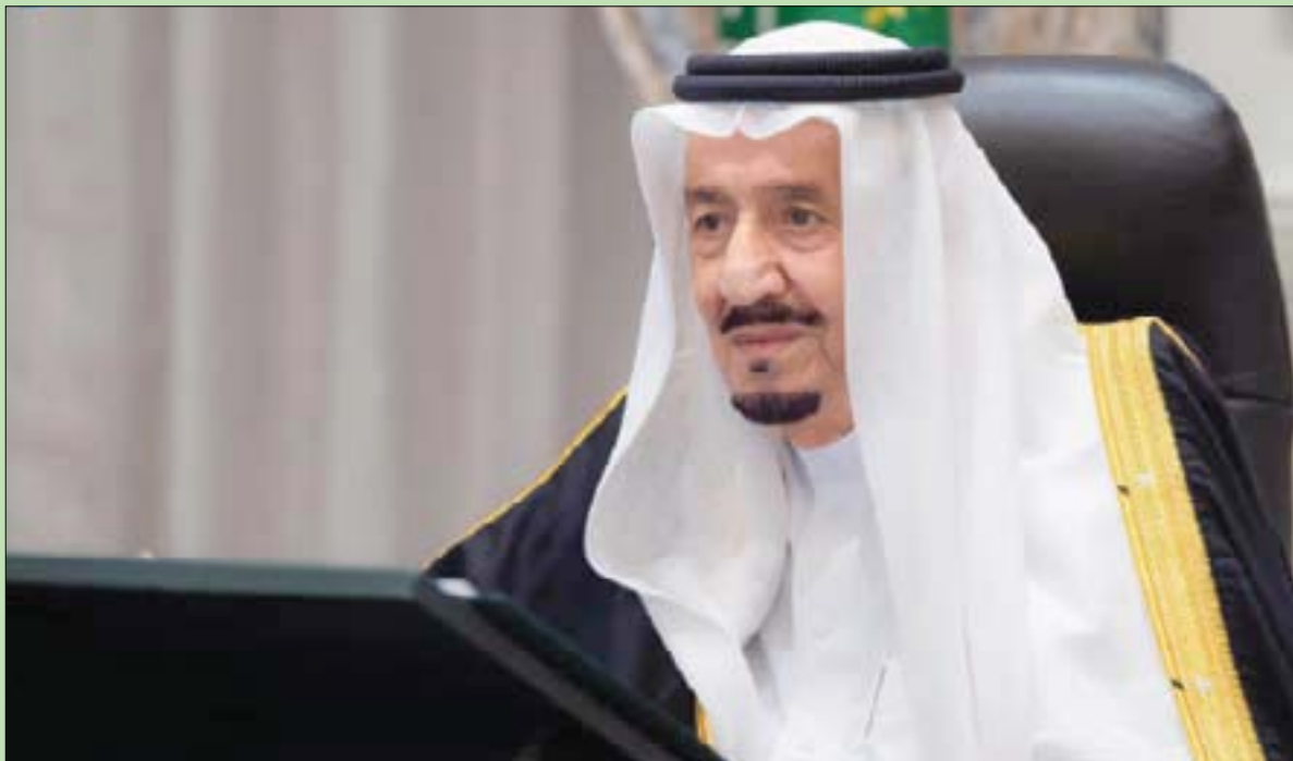
خادم الحرمين الشريفين لدى ترؤسه الجلسة المرئية لمجلس الوزراء

تطورات الأحداث على الساحتين الإقليمية والدولية، والمحلية، وأقر عدداً من الإجراءات، منها الموافقة على مذكرة تفاهم بين السعودية والكويت في مجال الرياضة، والموافقة على اتفاق تعاون بين البلدين في مجال الشباب. ووافق على مذكرة تفاهم بين وزارة الشؤون الإسلامية والدعوة والإرشاد في السعودية وإدارة التنمية الإسلامية الماليزية، وتفويض وزير البيئة والمياه والزراعة أو من ينوبه، بالتباحث مع الجانب الأرحنخيني في شأن مشروع مذكرة تفاهم للتعاون في مجال الزراعة. وقرّر تفويض محافظ الهيئة الملكية لمحافظة العلا، أو من ينوبه، بالتباحث مع منظمة الأمم المتحدة للتربية والعلم والثقافة، في شأن مشروع مذكرة تفاهم بين الهيئة الملكية لمحافظة العلا ومنظمة الأمم المتحدة للتربية والعلم والثقافة. وأقر المجلس قيام وزارة الموارد البشرية والتنمية الاجتماعية