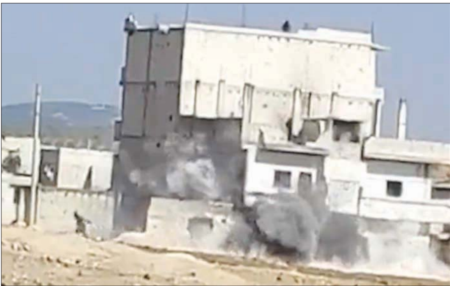
دخان يتصاعد من بناء غرب إدلب خلال تبادل قصف بين فصائل مقاتلة أمس (الشرق الأوسط)

وشهدت المحافظات السورية الشمالية: حماة وإدلب وحلب، العديد من الخلافات بين «هيئة تحرير الشام»، وفصائل أخرى، بدأت مطلع عام 2014 بخلاف بينها وبين «جبهة ثوار سوريا» وفصائل أخرى من «الجيش الحر» و«حركة أحرار الشام الإسلامية»، وانتهت بحل للجنة الفصائل، وانفردت بحكم المناطق الخارجة عن سيطرة النظام السوري، في إدلب وريفها ومناطق أخرى من أرياف حلب وحماة واللاذقية.