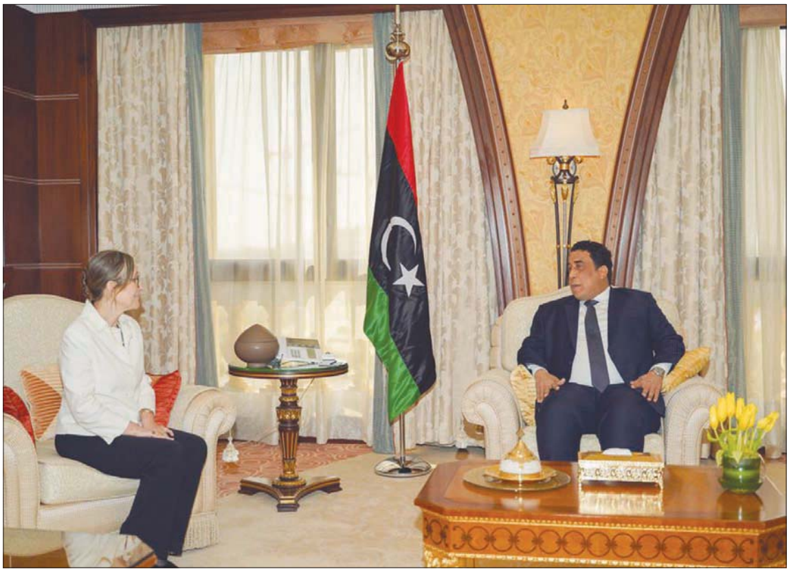
صورة وزعها مكتب رئيس المجلس الرئاسي الليبي لاجتماعه أمس مع رئيسة الحكومة التونسية

وبعدما رحبت بالإجراءات، التي اتخذتها حكومة «الوحدة» لتسهيل الاستعدادات لإجراء الانتخابات، وخصوصاً توفير التمويل الكافي للمفوضية والتدابير الأمنية اللازمة،