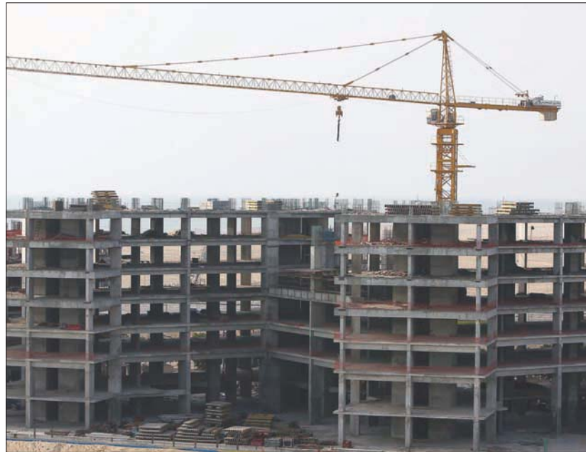
السعودية تبتكر صندوقاً لدعم مشاريع البنية التحتية (الشرق الأوسط)

والإتصالات والبنية التحتية الرقمية... وغيرها، مما سينعكس إيجاباً على تنمية الاقتصاد الوطني ويعزز من جودة حياة الفرد والمجتمع. من جانبه، أكد محافظ «صندوق التنمية الوطني»، ستيفن بول غروف، أن بدء العمل في إنشاء «صندوق البنية التحتية الوطني»، التي «ترافق وجود مشروعات ضخمة تدعمها (رؤية المملكة) في قطاعات البنية التحتية المختلفة تمثل فرصاً استثمارية جاذبة للقطاع الخاص». وبين أنه «جرى تعيين شركة (بلاك روك) شريكاً استراتيجياً للإسهام (صندوق) (صندوق البنية التحتية الوطني)، وذلك لتطبيق أفضل الممارسات العالمية في إدارة وحوكمة المؤسسات المالية المختصة والصناديق». وسيكون للصندوق «دور تكاملي مع المركز الوطني للتخصيص» من خلال تمويل مشروعات البنية التحتية التي سيتم تخصيصها أو طرحها عبر الشراكة بين القطاعين العام والخاص».