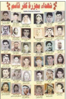
ملصق قديم لضحايا مجزرة كفر قاسم في فلسطين

المشروع، تقدمت به النائبة عايدة توما، التي تقول إن العديد من المسؤولين الإسرائيليين اعترفوا بهذه المجزرة، بينهم رئيس الدولة الأسبق شمعون بيريس، ورئيس الدولة السابق رؤوبين رافين، ورئيس الدولة الحالي يتسحاق هيرتسوغ. ويفترض أن القيادة السياسية يعتبرون تلك المجزرة الأليمة «خطيئة» ما كان لها أن تكون». ومن يريد البرهنة على أن موقفه صادق ضد المجزرة، عليه أن يصوت إلى جانب القانون، حتى تتحول إلى ذكرى