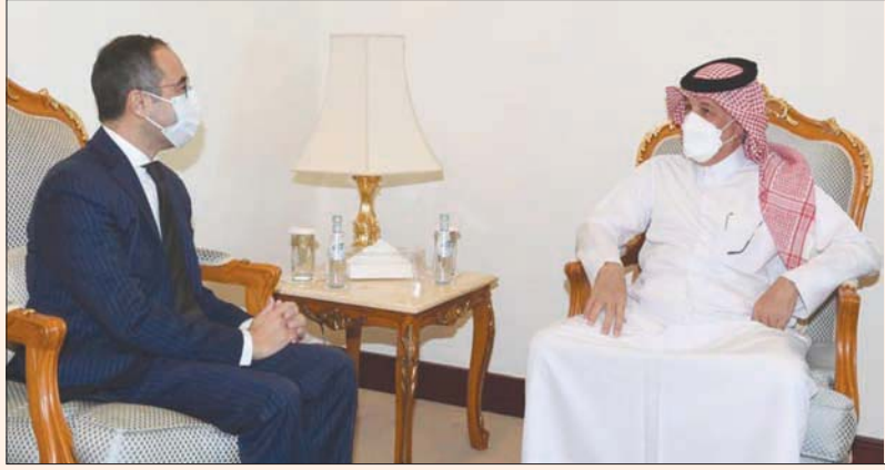
السفير المصري في الدوحة يلتقي وزير الدولة القطري للشؤون الخارجية

من جهة، والدوحة من جهة أخرى، وذلك بعد نحو 4 سنوات من قطع العلاقات، وفي أعقاب ذلك تبادل وزير الخارجية في مصر وقطر الزيارات، والتقى الرئيس المصري عبد الفتاح السيسي، أمير قطر الشيخ تميم بن حمد، في بغداد بشكل ثنائي في أغسطس (آب) الماضي، وبحسب «الخارجية المصرية» فقد أشار السفير المصري إلى «التطور الذي تشهده العلاقات في الفترة الحالية»، وأعرب عن «تطلعه للعمل على تعزيز أوجه التعاون والارتفاع بها في المجالات كافة»، وكان ملف استعادة العلاقات المصرية - القطرية قد اتخذ الفكرة الماضية مساراً متسارعاً، عبر لقاءات جمعت وزراء وسفراء من البلدين تنظر لعلاقات التعاون واليات تعزيزها. وأكد عدد من المسؤولين المصريين في وقت سابق أن «الفترة الحالية تشهد جهوداً مكثفة لحكومتى البلدين لتحقيق المزيد من التقارب بين مصر وقطر على المستويين السياسي والاقتصادي»، فيما أشار سفير قطر بالقاهرة سالم مبارك آل شافي في تصريحات سابقة إلى «الرغبة المشتركة لكلا البلدين لبدء مرحلة جديدة من التعاون الثنائي في شتى المجالات وعلى مختلف الأصعدة».