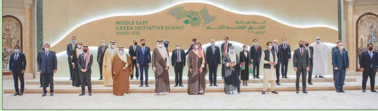
الأمير محمد بن سلمان يتوسط قادة ورؤساء الدول المشاركة في قمة مبادرة «الشرق الأوسط الأخضر» بالرياض أمس (واس)

تمويل قرابة 15 في المائة منها، كما ستعمل المملكة مع الدول وصناديق التنمية الإقليمية والدولية لبحث سبل تمويل وتنفيذ هذه المبادرات. وأوضح ولي العهد السعودي، عن تأسيس مؤسسة المبادرة الخضراء كمؤسسة غير ربحية لدعم أعمال القمة مستقبلاً، بجانب تأسيس برنامج إقليمي لاستمطار السحب، وتأسيس مركز إقليمي للتنمية المستدامة للفروة السمكية، وكذلك تأسيس مركز إقليمي للإنذار المبكر بالعواصف