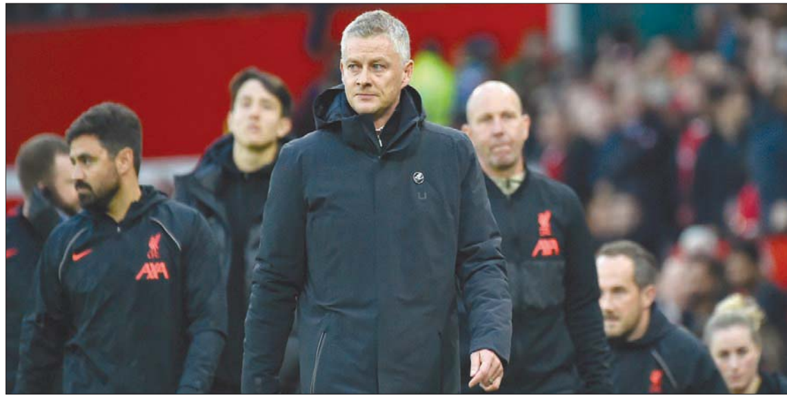
سولسكاير يخرج مهموماً بعد هزيمة يونايتد الثقيلة أمام ليفربول

واحد من أهدافه هو الفوز بالبطولة، لكنه في حالة تاهب لقبول العرض. وكان جيمي كارجر، مدافع ليفربول ومنتخب إنجلترا السابق المحلل في قناة «سكاي سبورتنس»، قد أكد أن مانشستر يونايتد يحتاج مدرب أفضل، حيث لا يمكن مقارنة مدربه سولسكاير بالثلاثي يورغن كلوب (مدرب ليفربول) وجوسيب غوارديولا (مانشستر سيتي) وتوماس توخيل (تشيلسي)، حيث قال كارجر: «اعتقد أن سولسكاير قام بعمل جيد، لكن عند مقارنته