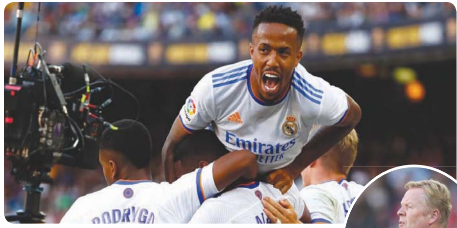
لاعب ريال منتشون بالفوز على برشلونة في عقر داره

توقع الجميع أن يخسر برشلونة الكثير من هيئته بعد رحيل النجم الأرجنتيني ليونيل ميسي، لكن أن تصل الأمور إلى حد خسارة موقعة الـ«كلاسيكو» على أرضه للمرة الثانية تواليًا، فهذا يظهر أن الأمر يتعلق بأكثر من فقدان لاعب، حتى وإن كان بحجم أفضل لاعب في العالم ست مرات. وأبرز دليل على الأمر لا يتعلق بلاعب، بل بمنظومة لعب، هو أن ريال خسر جهود النجم البرتغالي كريستيانو رونالدو لصالح يوفنتوس الإيطالي في صيف 2018 وخسر هذا الموسم قائده المدافع سيرجيو رابوس الذي سار بنفس وجهة ميسي بانقله إلى باريس سان جيرمان الفرنسي، لكن ذلك لم يؤثر على النادي الملكي الذي يجد نفسه على بعد نقطة من الصدارة ومتقدماً بنحس على غريمه الكاتالوني بعد فوزه الأخير 2-1 في الكلاسيكو، كما يتصدر أيضاً مجموعته في دوري الأبطال.