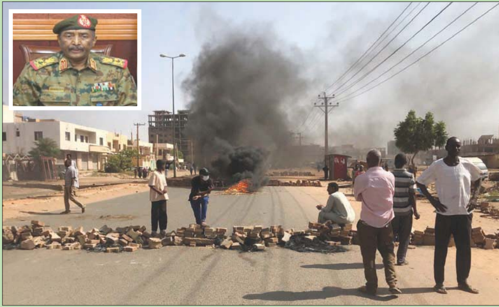
محتجون يسدون شارعاً في الخرطوم أمس... وفي الإطار الفريق عبد الفتاح البرهان يلقي كلمة متلفزة

الأميركي للقرن الأفريقي جيفري فيلتمان في الخرطوم خلال الأيام الثلاثة الماضية. وعبر عدد من الدول العربية والدولية عن قلقها إزاء أحداث السودان، وناشدوا جميع الأطراف اللجوء إلى الحوار والابتعاد عن العنف في التعامل مع الأحداث الحالية والالتزام بـ «الوثيقة الدستورية». وقالت الخارجية السعودية إن المملكة «تتابع بقلق وإهتمام بالغ الأحداث الجارية في جمهورية السودان الشقيقة، وتدعو إلى أهمية ضبط النفس والتهدئة وعدم التصعيد».