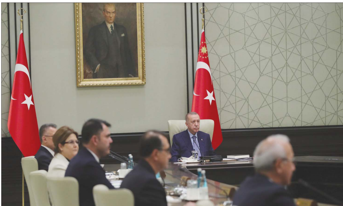
إردوغان خلال ترؤسه اجتماعاً للحكومة في أنقرة أمس (رويترز)

إلى 8,6 ألف دولار ما يعني تراجع القوة الشرائية وازدياد الفقر، ما يفسر تراجع شعبيه «العدالة والتنمية»، حزب الرئيس التركي. وتبين الأرقام الرسمية تراجع قيمة الاستثمارات في الاقتصاد التركي ما يضاعف من وقع الانعكاسات السلبية وينسف التنمية. من هنا، يرى الباحث الفرنسي أن إردوغان يسعى «لطمس الواقع الاقتصادي السيئ وصرف الأنظار من خلال استنارة الشعور القومي وإعادة شد عصبية مجازيه ونخبه ولكن كل ذلك لا علاقة له بمدف العدالة وكيفية عملها». وقالت وكالة الصحافة الفرنسية عن الباحث الاقتصادي في مجموعة «بلوباي أست مانجمنت» تيموتي أش قوله إنه في حال نفذ إردوغان تهديده فإن ذلك سيغني تراجع المبادرات التجارية ومعهما الاستثمارات من الدول العشر المعنية.