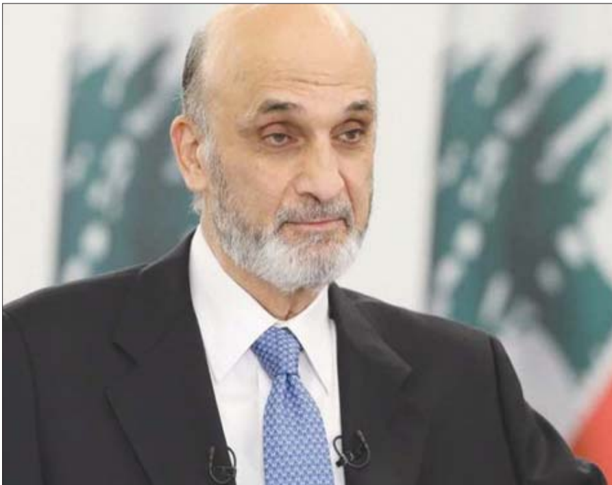
رئيس حزب «القوات اللبنانية» سمير جعجع

وسأل: «ماذا عندما تكون التحقيقات جرمية تسير بشكلها الطبيعي والقانوني برض من الضحايا يُستدعى إلى التحقيق؟ وعندما تتجاوز التحقيقات الدستور والقوانين يبدأ التنظير، كما يحدث في جريمة المرقا التي يُصرّ المحقق العدلي على الاستمرار في محادثاته وارتكابه الدستورية والقانونية دون رادع ولا حسب ولا رقيب، بل بكيدة واستنسابية وانتقائية مضفوحة ومكشوفة».