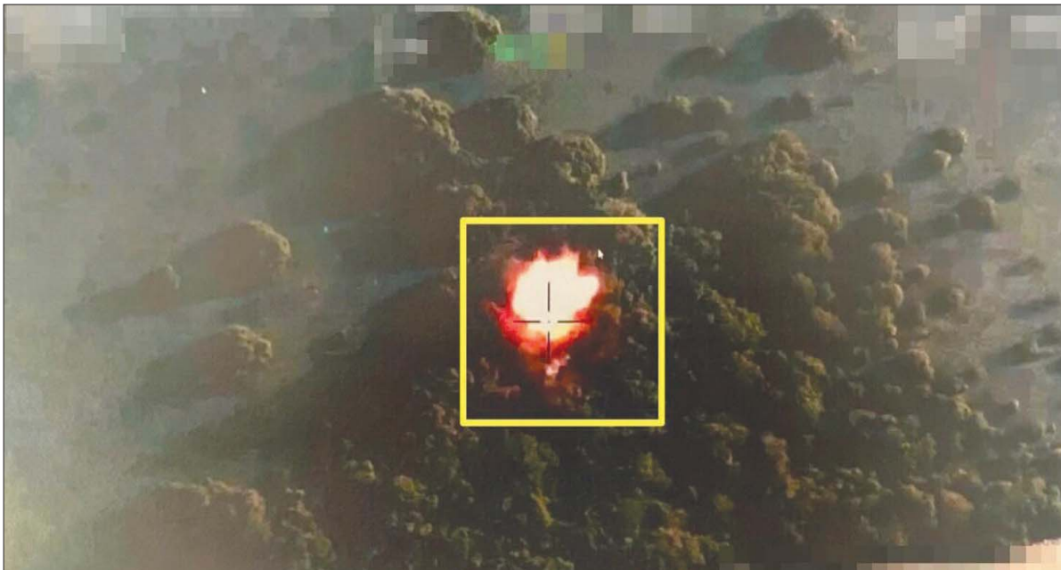
صورة من الجو وزعها التحالف العربي أمس لتدمير زورق مفخخ بجزيرة كمران

كما التقى عدداً من المهجرين والنازحين من المديرية الجنوبية والمحافظة الأخرى إلى