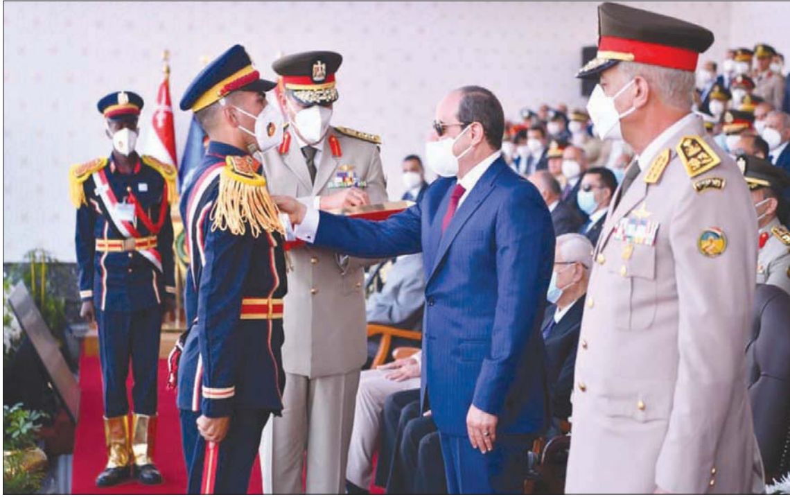
السيسي يشهد حفل تخرج دفعات جديدة من الكليات والمعاهد العسكرية

لتقوم بهذا الدور مع الطلاب»، وشدد الرئيس المصري قبل أيام خلال احتفالية وزارة الأوقاف بذكرى «المولد النبوي الشريف» على أهمية «قضية الوعي الرشيد، وفهم صحيح الدين التي ستظل من أولويات المرحلة الراهنة»، ورأى أن «بناء وعي أي أمة، بناءً صحيحاً هو أحد أهم عوامل استقرارها وتقدمها، في مواجهة من يحرقون الكلام عن مواضعه، ويخرجونه من سياقه».