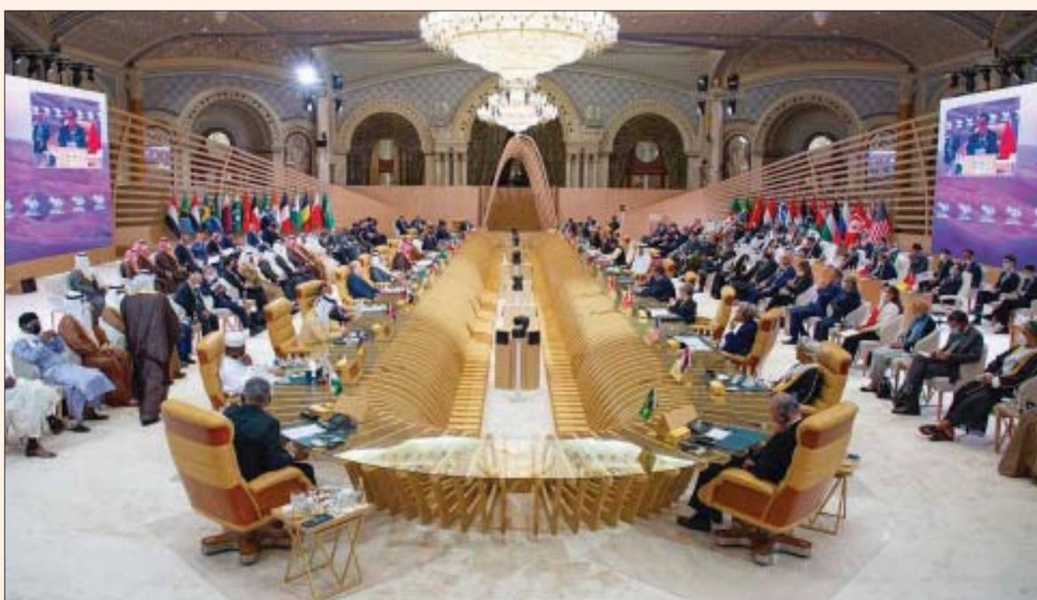
حضور رفيع لحكومات المنطقة ودول عالمية مشاركة في قمة الشرق الأوسط الأخضر (الشرق الأوسط)