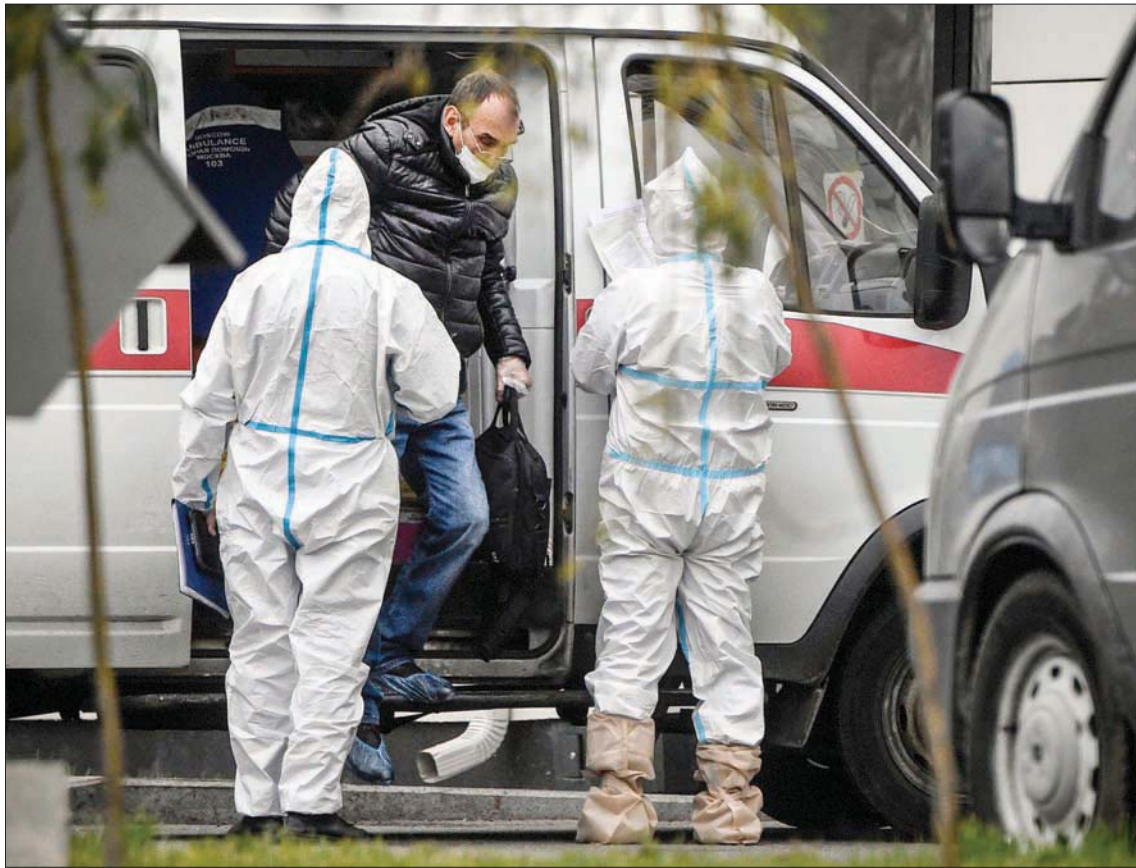
مصعب ب «كورونا» يصل إلى مستشفى خارج موسكو أول من أمس (أ.ف.ب)