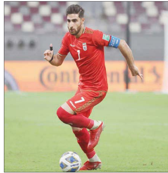
علي رضا