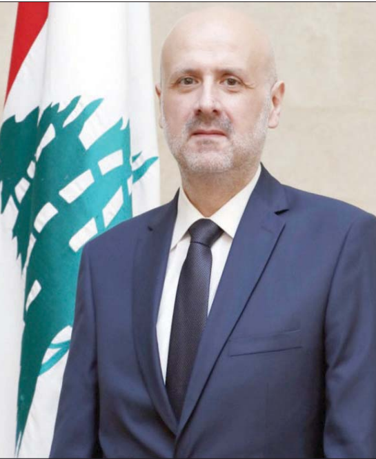
الوزير بسام مولوي

بيروت، «الشرق الأوسط» أكد رئيس الحكومة اللبنانية نجيب ميقاتي أن «لبنان قادر رغم الصعوبات على النهوض من جديد والبدء بالإصلاحات الداخلية المطلوبة لوقف النزف المالي والنهوض بالإدارة والمؤسسات، بالتوازي مع بدء مفاوضات مع صندوق النقد الدولي لوضع برنامج إصلاح طويل الأمد».