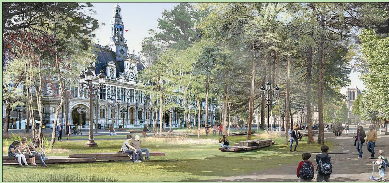
رسم لـ«غابة حضرية» في منطقة مونبارناس (بلدية مونبارناس)

باريس - لندن، «الشرق الأوسط» بحلول 2024، تشهد باريس إطلاق أول «غابة حضرية» في منطقة مونبارناس، وسط العاصمة الفرنسية، على ما أعلنه المساعد المسؤول عن شؤون الغطاء النباتي في بلدية المدينة كريستوف نادجوفسكي. وقال نادجوفسكي: «بحلول عام 2024، سيكون لدينا أول غابة حضرية في ساحة كاتالونيا» التي ستصبح «مغطاة بدرجة أكبر بكثير بالنباتات»، معلناً عن إطلاق المشاورات في هذا المشروع الأسبوع المقبل. ومن بين نحو 10 مواقع لا تزال قيد الدراسة لاستضافة هذه الغابات الحضرية، ثمة حالياً ملفان «أكثر تقدماً»، بحسب أوساطه، وهما: محيط مقر بلدية باريس وساحة كولونيل - فايان، وفق وكالة الصحافة الفرنسية. وكانت هذه المشاورات جزءاً من برنامج ذي منى بيئي اعتمدهته رئاسة بلدية باريس أن إيدالغو (اشتركية) خلال حملة لإعادة انتخابها سنة 2020. وقد أطلقت إيدالغو، في 12 سبتمبر (أيلول) الماضي، حملتها للانتخابات الرئاسية الفرنسية المقررة في إبريل (نيسان) المقبل.