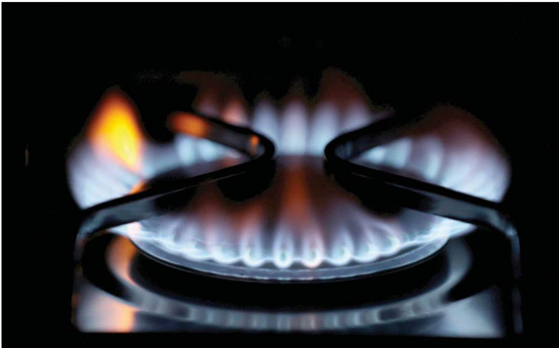
بلغت أسعار الغاز أعلى مستوياتها في دول التكتل الذي يضم 27 دولة مع ارتفاع الطلب وتراجع الواردات من روسيا والنرويج

التي شددتها بعد «بريكست»، وذلك من أجل إصدار ما يصل إلى 10 آلاف و500 تأشيرة عمل مؤقتة. والأسبوع الماضي أعلنت أنها ستصدر فوراً 300 تأشيرة عمل مؤقتة لسائقي الصهاريج.