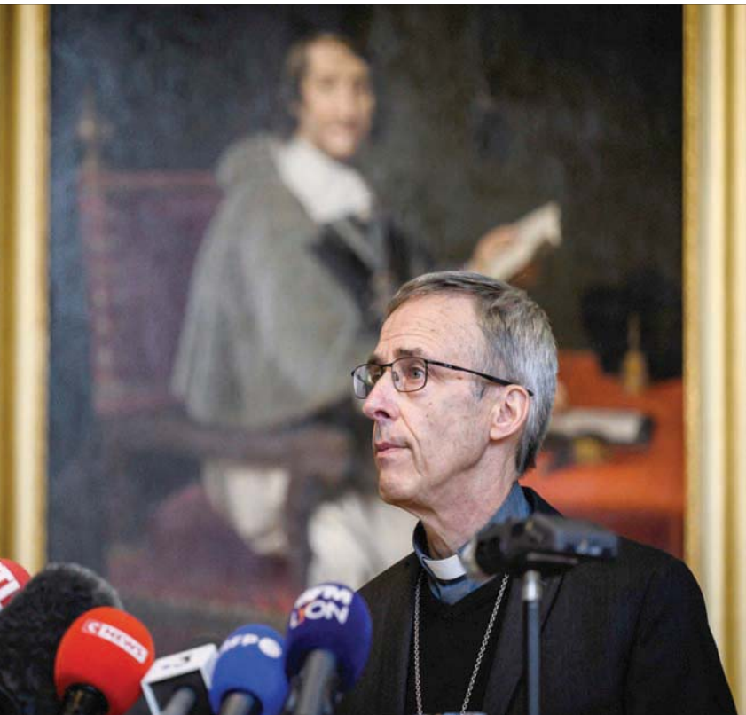
كبير أساقفة مدينة ليون يتحدث للصحافيين بعد نشر التقرير

ووصف خلال حديثه المؤمنين في الفاتيكان، الوضع بأنه «مأساة» و«لحظة العار» و«تجربة قاسية»، وحث الكاثوليك الفرنسيين على «تحمل مسؤولياتهم لكي يضمنوا أن تصبح الكنيسة بيتاً آمناً للجميع»، مطالباً ب«بذل كل الجهود حتى لا تتكرر هذه المأساة». وكان الناطق باسم البابا قد قال مساء أول من أمس (الثلاثاء)، إنه «يشعر بالحرز العميق للجروح (التي لحقت بالضحايا) وبالامتنان لهم لشجاعتهم في كشف الاعتداءات) كما أنه يستدير باتجاه السلطات الكنسية التي يتعين عليها العمل على طريق الخلاص بعد أن وعت الحقيقة المريعة». وإذا كان البابا يتحدث