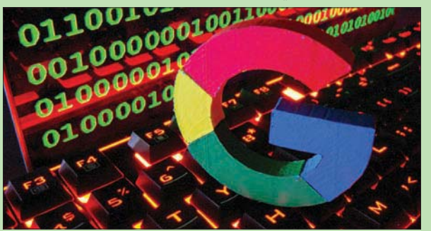
«غوغل مابس» تعرض الطرق الأقل تلويناً (ريوتنز)

لندن، «الشرق الأوسط» وتشجع غوغل أيضاً مستخدميها على اتخاذ قرارات تراعي البيئة في حياتهم اليومية، بما يشمل اختيار الطريق الأقل تسبباً بالانبعاثات خلال التنقل باستخدام بلد اعتماد الخيارات الأسرع. وكانت قد أعلنت مجموعة التكنولوجيا العملاقة أسس الأربعة عن تحديثات لخدمات الأربعة تابعة لها في هذا الاتجاه. وستعرض خدمة الخرائط «غوغل مابس» على سبيل المثال، بصورة تلقائية للمستخدمين سلوك الطرق الأقل تلويناً في حال كان وقت الوصول المتوقع مشابهاً، حسب وكالة الصحافة الفرنسية. وسيكون لهذه الخاصية التي يبدأ العمل بها في الولايات المتحدة ثم في أوروبا سنة 2022 «الأثر عينه العام المقبل لسحب ماكني ألف سيارة من الشوارع العام المقبل»، على ما أكد رئيس المجموعة سوندار بيشاي خلال مؤتمرها الصحفي الثلاثاء. وأضاف بيشاي: «على صعيد فردي، قد تبدو هذه الخيارات بسيطة لكن مع تراكمها المجموعة سوندار بيشاي (ستحصل تحولات هامة للوكوب».