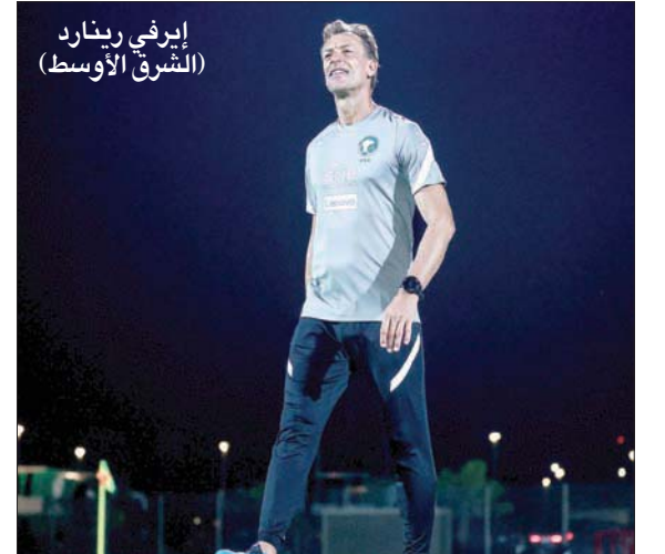
إيفري رينارد (الشرق الأوسط)

أكد الفرنسي إيفري رينارد، مدرب المنتخب السعودي، جاهزية الأخضر لمواجهة اليابان اليوم، ضمن الجولة الثالثة من تصفيات الدور الآسيوي الحاسم المؤهل لنهائيات كأس العالم 2022 في قطر، مؤكداً رغبة اللاعبين في حسم النقاط الثلاث لصالحهم.