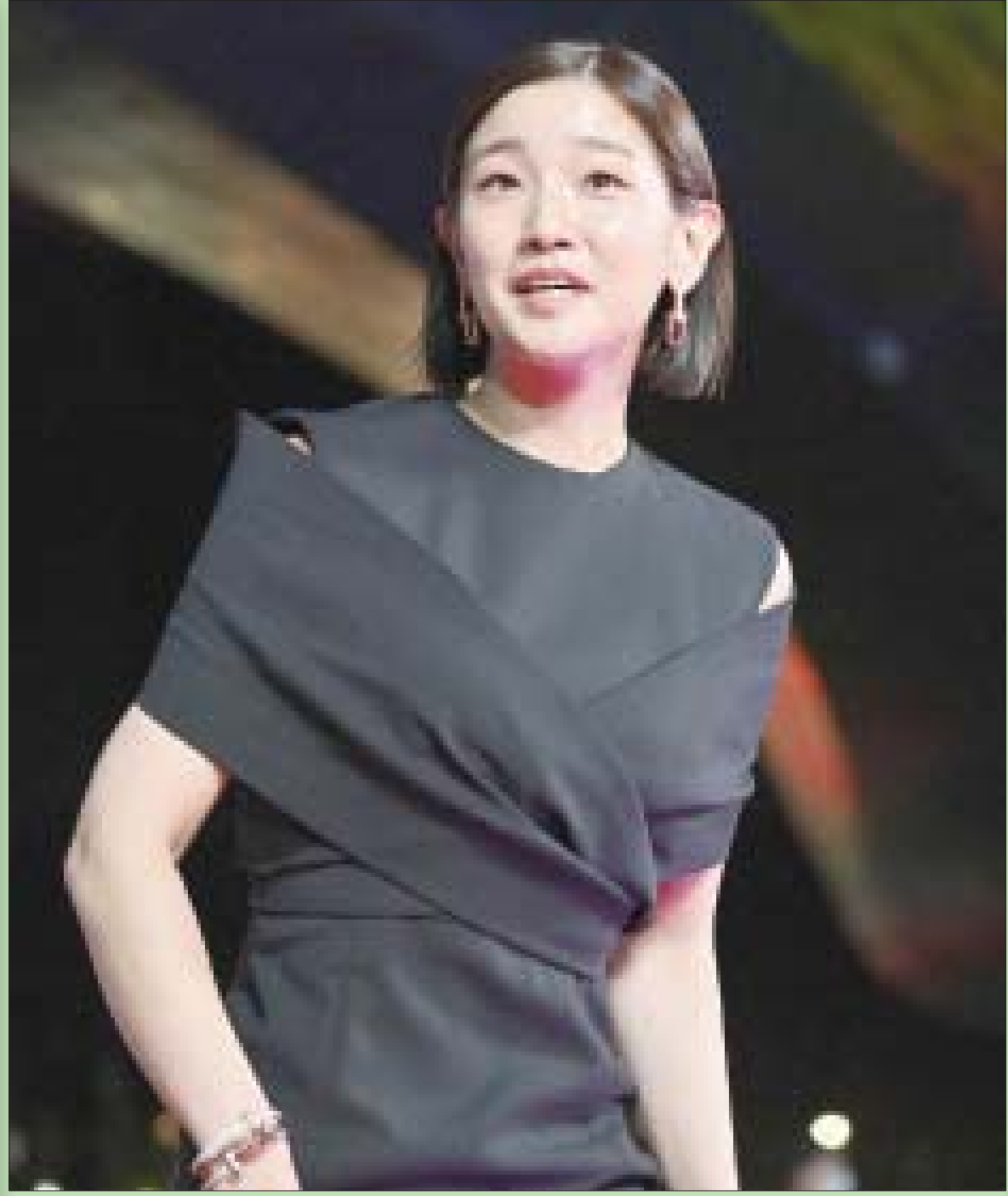
المثلة الكورية الجنوبية بارك سو دام تقف أمام المصورين خلال حفل افتتاح مهرجان بوسان السينمائي في مدينة بوسان أمس

وعندما حاولوا الصلح بينهما رفض، فسالوه: هل تريد أن تطلقها؟، قال لهم: لا فانا خايف من انتقامها، ولكن أرجوكم أخبروها انتم على أن تطب هي (الخلع) مني، وسوف استاجر بعد ذلك (بودي غارد) ليكون برفقتي أينما ذهبت، ويحرسني عندما أنام.