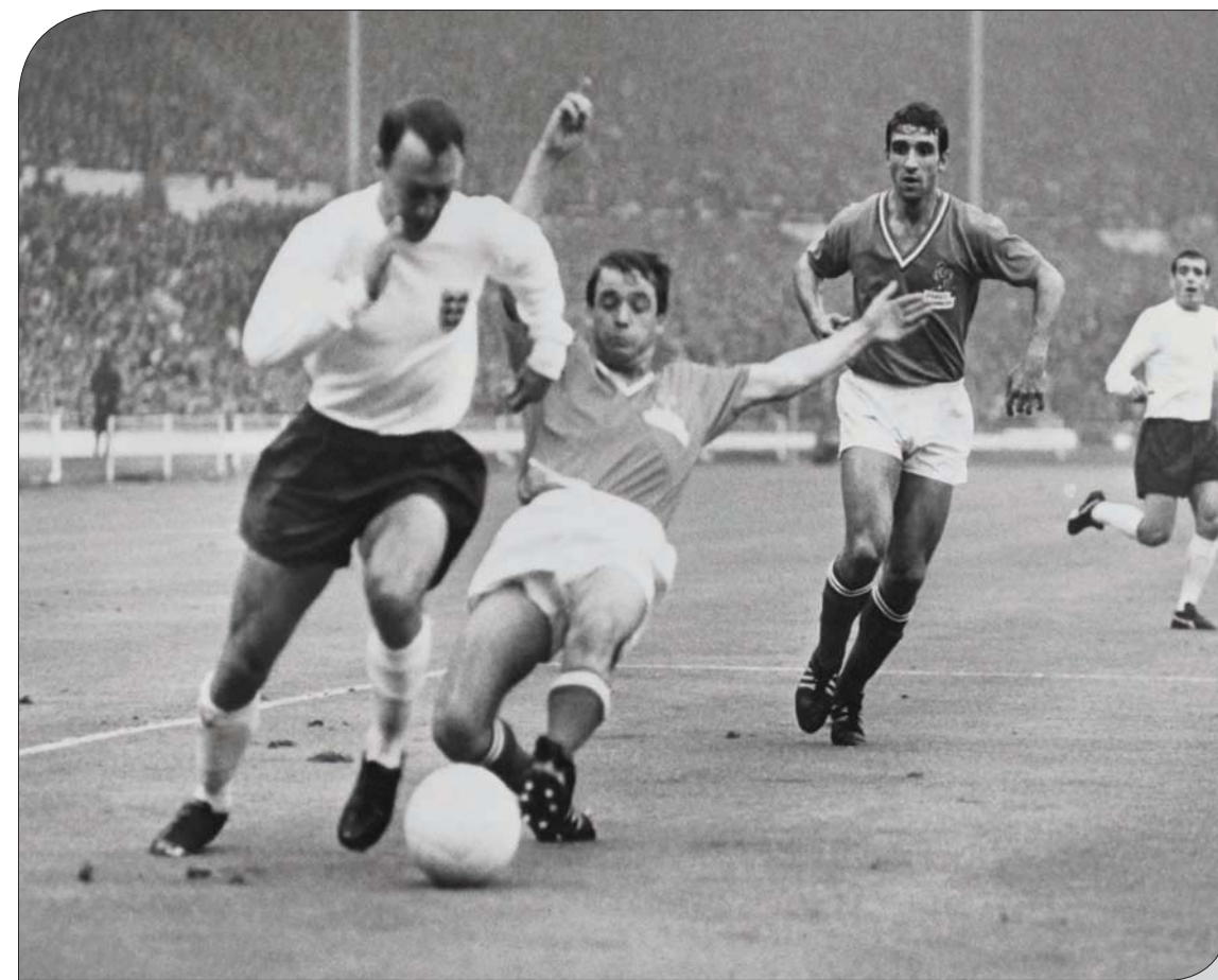
غريفز يمر من لاعب منتخب فرنسا جاكى سيمون في مواجهة إنجلترا وفرنسا في دور المجموعات بمونديال 1966 (أ.ب)

شخصيات مثل نورمان غيلر، وبيتر ويلسون، وديزموند هاكيت، وغيفري غرين. وكان أحد رفاقه المفضلين هو لوري بينون الذي تعهد بعد 5 سنوات من حياته كاسير حرب بأن يستمتع بالحياة على أكمل وجه ممكن، وقد فعل ذلك بالفعل.