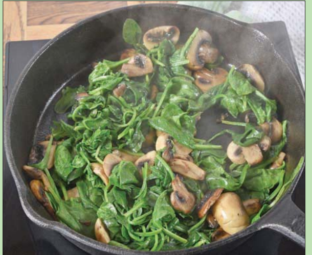
الأغذية المليئة بالسبانخ والفطر مهمة للجسم

توصلت دراسة إلى أن اتباع نظام غذائي غني بالخضراوات الخضراء والمليئة بالسبانخ والفطر يقلل من خطر الإصابة بأمراض القلب بمقدار الربع. وجدت الدراسة أنه إذا زاد الناس من تناولهم للأطعمة الغنية بالحديد، مثل اللحوم الحمراء، والسبانخ، والفطر، والتوفو، والعدس لتقليل احتمالية الإصابة بالنوبات القلبية. ووجد الخبراء أن نقص