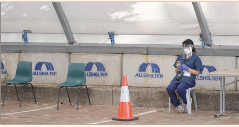
عاملة صحة تأخذ قسطاً من الراحة في مركز فحص سريع بسيدني الثلاثاء

جنيفيف، «الشرق الأوسط» انتهى تماماً». وتسبب فيروس كورونا وبؤفة قرابة 5 ملايين شخص في العالم، منذ أبلغ مكتب منظمة الصحة العالمية في الصين عن ظهور المرض نهاية ديسمبر (كانون الأول) 2019. وقالت فان كيركوف إن المتوفين مؤخراً من جراء فيروس كورونا هم بغالبيتهم غير ملقحين. وانتقدت المسؤولية في منظمة الصحة المعلومات المغلوطة والمضللة حول «كوفيد - 19» التي يتم تداولها على الإنترنت. وقالت إن هذه «المعلومات تؤدي إلى وفيات. لا مجال لتنميق الأمر». ولفتت المسؤولية التقنية عن مكافحة كوفيد - 19 إلى أن منظمة الصحة العالمية تجري مناقشات حول ما سيكون عليه وضع الجائحة في فترة الثلاثة أشهر إلى الـ 18 شهراً المقبلة. وتوقعت فان كيركوف السيطرة على كوفيد - 19 في نهاية المطاف. وقالت «لكن سنبقى هناك جيوب من الأفراد غير الملقحين، إما لعدم توفر اللقاح لهم أو لرفضهم التلقيح أو لتعذر تلقيهم اللقاح»، محذرة من تحدد التفشي. وشددت على أن الفيروس لن يقضى عليه، وسيبقى موجوداً. وقالت «خسرنا منذ المراحل الأولى إمكانية القضاء على هذا الفيروس على الصعيد العالمي». وأوضح أن السبب في خسارة هذه الإمكانية هو «أننا لم ننصّب لهذا الفيروس على الصعيد العالمي بأقوى ما أمكننا».