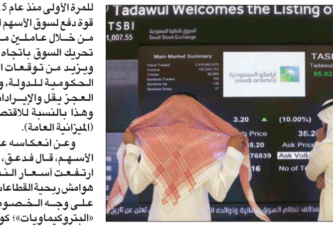
سهم «أرامكو السعودية» يسجل أداءً إيجابياً (آب)

حدثت في أوقات سابقة، البعض منها مضاربة ولم تكن بفعل عوامل أخرى، وما يحدث الآن من ارتفاع في أسعار النفط يدعم ويدفع هذه الارتفاعات، لافتاً إلى أن الشركات التي سجلت ارتفاعات لن تتراجع في المرحلة المقبلة، والتي لم ترتفع سنسجل صعوداً لم تحققة في وقت سابق، وبالتالي فإن التحسن سيظل جميع الشركات المرجحة. وأشار فدعق، أن تحديد السيولة وارتفاعها يبحث فيه عن القيمة، ضارباً مثلاً على ذلك خلال 4 صفقات بملايين الأسهم على «أرامكو»؛ ما يجعل الشركة سبباً في تدفق السيولة. وزاد «البنوك لديها سيولة عالية وهذه السيولة في حاجة إلى أن يكون هناك نشاط في الاقتصاد». إلى ذلك، قال الخبير المالي،