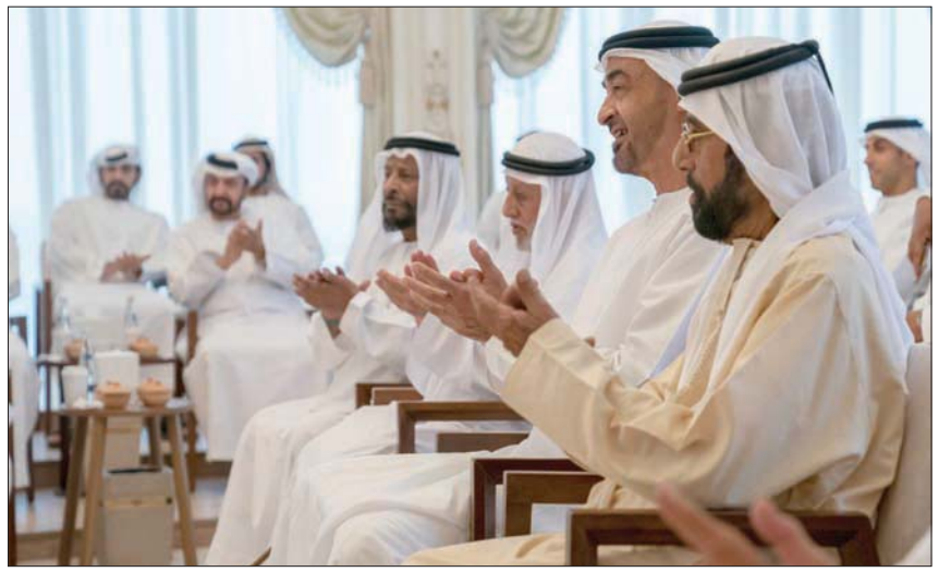
أكد ولي عهد أبوظبي نجاح الإمارات في الخروج من أزمة «كورونا»

التي أسهمت في بدء عودة الحياة إلى طبيعتها هي ثلاثة، «توفر اللقاحات» و«استمرارية الفحوصات»، بجانب «توفر بعض العلاجات الحديثة» في