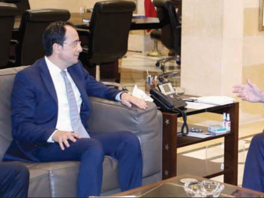
الرئيس ميقاتي مستقبلاً وزير خارجية قبرص أمس (الاتي ونهرا)

التي رأيناها واطلعنا عليها، ونتمنى أن تكون هناك مجموعة من القرارات قبل الاجتماع المقبل ولينا للدول المانحة، بالتعاون مع ممثلي المجتمع المدني ومؤسسات حكومية مختلفة، ونحن نرغب في استمرارية العمل الجيد في هذا الإطار، وقد كان الاجتماع مشجعاً». وتحدثت الممثلة الإقليمية للبنك الدولي فقالت: «تباحثنا مع دولة الرئيس في التسهيلات التي رأيناها واطلعنا عليها، ونتمنى أن تكون هناك مجموعة من القرارات قبل الاجتماع المقبل ولينا للدول المانحة، بالتعاون مع ممثلي المجتمع المدني ومؤسسات حكومية مختلفة، ونحن نرغب في استمرارية العمل الجيد في هذا الإطار، وقد كان الاجتماع مشجعاً».