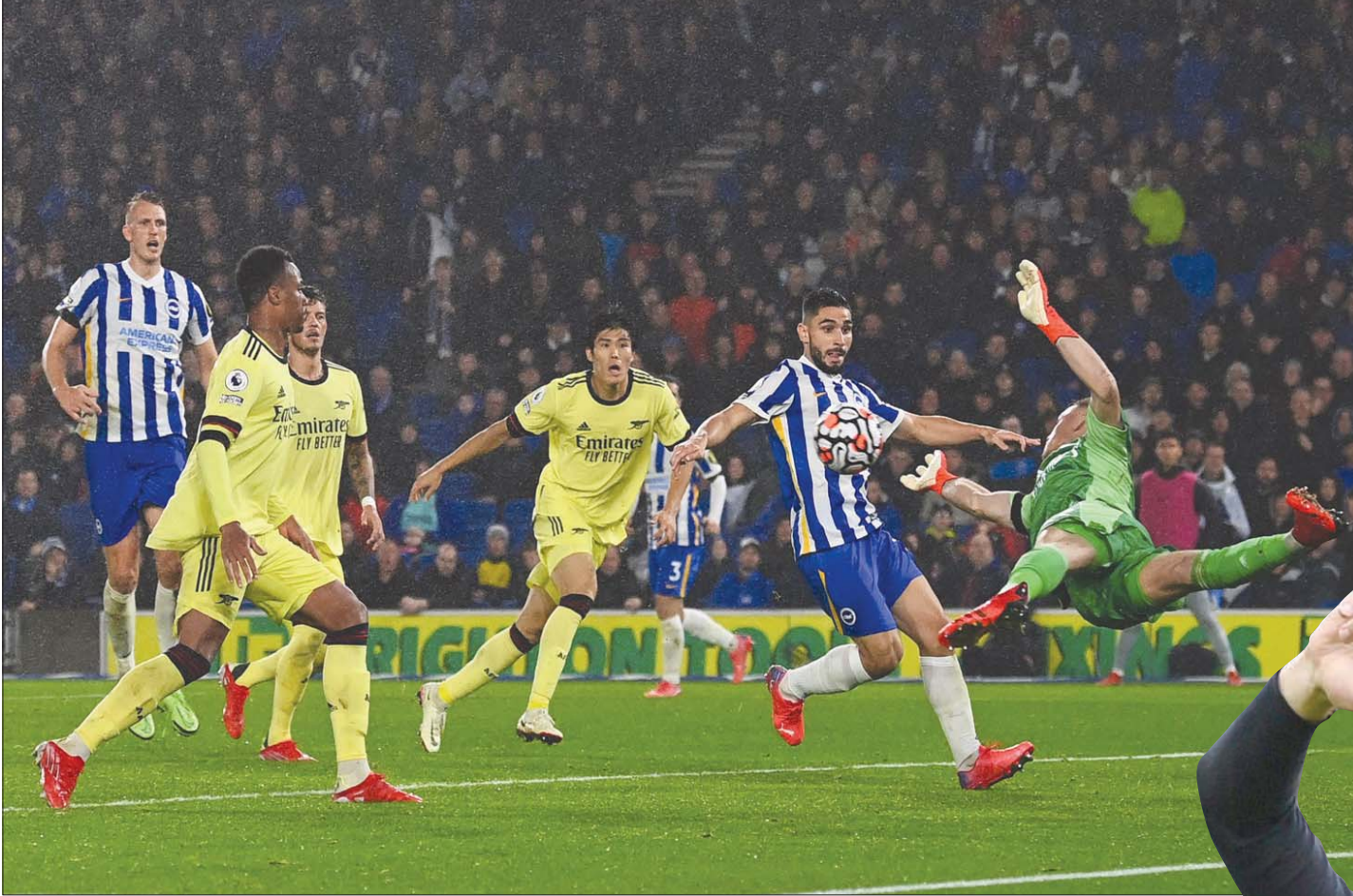
إحدى الفرص الضائعة من برايتون في مواجهة مع أرسنال كان يستحق الفوز بها

وبعد الفوز على لستر سيتي، والتعادل مع كريستال بالاس وارسنال، سيلعب نوريتش سيتي. وإذا حقق الفريق الفوز على نوريتش - وهو متوقع - ومع مرور نحو 20 في المائة من مباريات الموسم، سيكون الفريق قد قطع نصف الطريق بالفعل نحو البقاء في الدوري الإنجليزي الممتاز. وبعد ذلك، يمكن للفريق أن يحلم بإنهاء الموسم ضمن المراكز المؤهلة للبطولات الأوروبية وتحقيق إنجاز يؤكد أن بوت يمتلك قدرات جيدة للغاية كمدير فني!