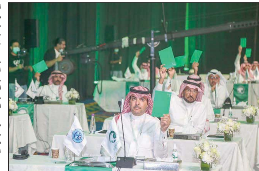
اجتماع الجمعية العمومية لاتحاد الكرة السعودي أمس عقد وسط تكتم إعلامي شديد

أما بند ضريبة القيمة المضافة فنال 23 مليونا مقابل 14 مليونا في 2020، أما الانتدابات والمرافقات فبلغت مليوناً ونصف المليون ريال مقابل مليونين و300 ألف في 2020، فيما خصص مبلغ مليونين و100 ألف لاستيفاء