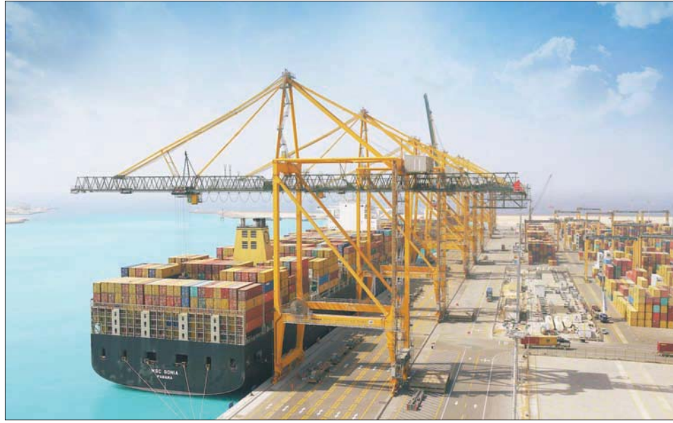
السعودية تدعم المنشآت في حركة تصدير الإنتاج السعودي إلى بلدان العالم

النفطية من 16 إلى 50 في المائة، وفق مستهدفات «رؤية المملكة 2030». طلبات التمويل وأعلن بنك التصدير والاستيراد السعودي أن طلبات التمويل المعتمدة ارتفعت لتصل إلى 89 طلباً، بقيمة إجمالية تخطت 2,9 مليون ريال (786 مليون دولار)، مشيراً إلى أن نسبة المنشآت الصغيرة والمتوسطة الممولة بلغت 51 في المائة من إجمالي الطلبات، كما أطلق 9 منتجات تمويل وتمارين تناسب احتياجات المصدّرين السعوديين المختلفة. وكشف البنك عن أبرز القطاعات التي استفادت من منتجاته، وهي المنتجات الغذائية التي شكلت نسبة 24 في المائة، ثم الحديد والصلب 10,5 في المائة، والمطاط واللدائن 8,4 في المائة، ومنتجات الورق 7,7 في المائة، والأدوية 7,5 في المائة، والزراعة والاستزراع السمكي بنسبة 4,5 في المائة، إلى جانب قطاعات البتروكيماويات (التشييد والبناء والبلاستيك). ووافقت السعودية على تنظيم بنك التصدير والاستيراد السعودي خلال العام الماضي، بهدف تعزيز تنمية الصادرات السعودية وتنويعها، وزيادة قدرتها على التنافس في الأسواق العالمية في مختلف القطاعات،