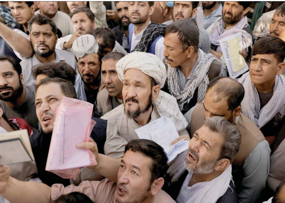
توافد مئات على مكتب إصدار الجوازات في كابل على رغم أنهم أبلغوا بأن توزيعها لن يبدأ قبل يوم السبت

هذه الأوضاع». وقالت طالبان إنها ترحب بالمساعدات الدولية، لكن كثيراً من المانحين حمداً على مساعدتهم بعد سيطرة الحركة على السلطة. وفي سياق متصل بدأت وزارة الدفاع الألمانية أمس الأربعاء مناقشة الدروس المستفادة من مهمة القوات