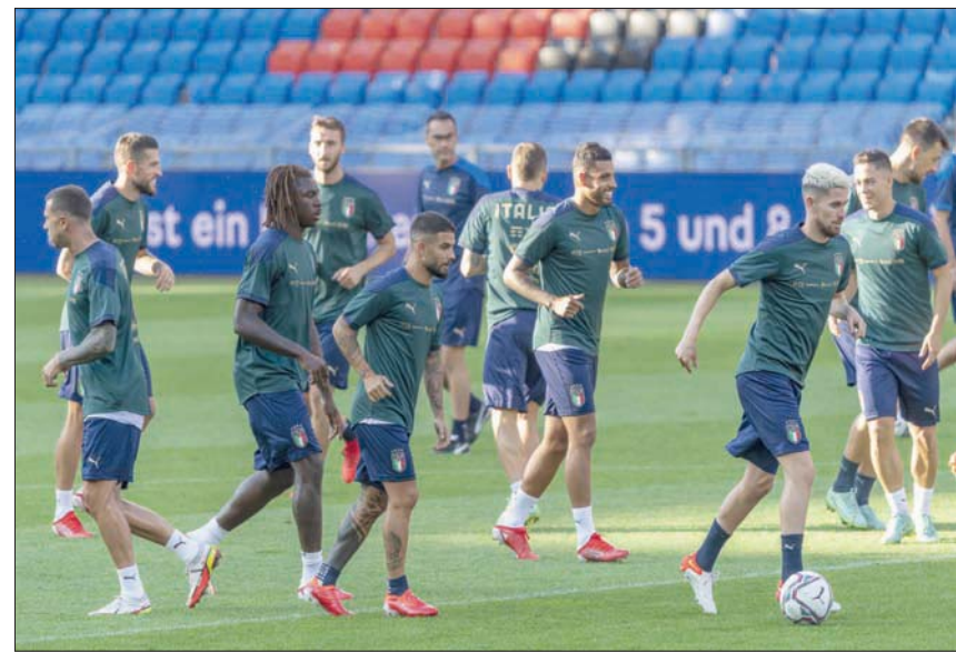
لاعبو إيطاليا يتطلعون لحصد لقب جديد بعد التتويج بكأس «يورو 2020»

وتحدث مانشيني عن أهمية الفوز بكأس أوروبا بالنسبة للشعب الإيطالي، قائلاً: «الجميع يريد أن يفوز بكأس أوروبا 4 مرات. نحن