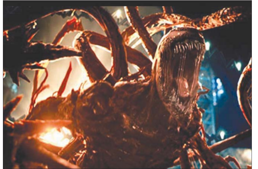
وحش الأسبوع: «فينوم»