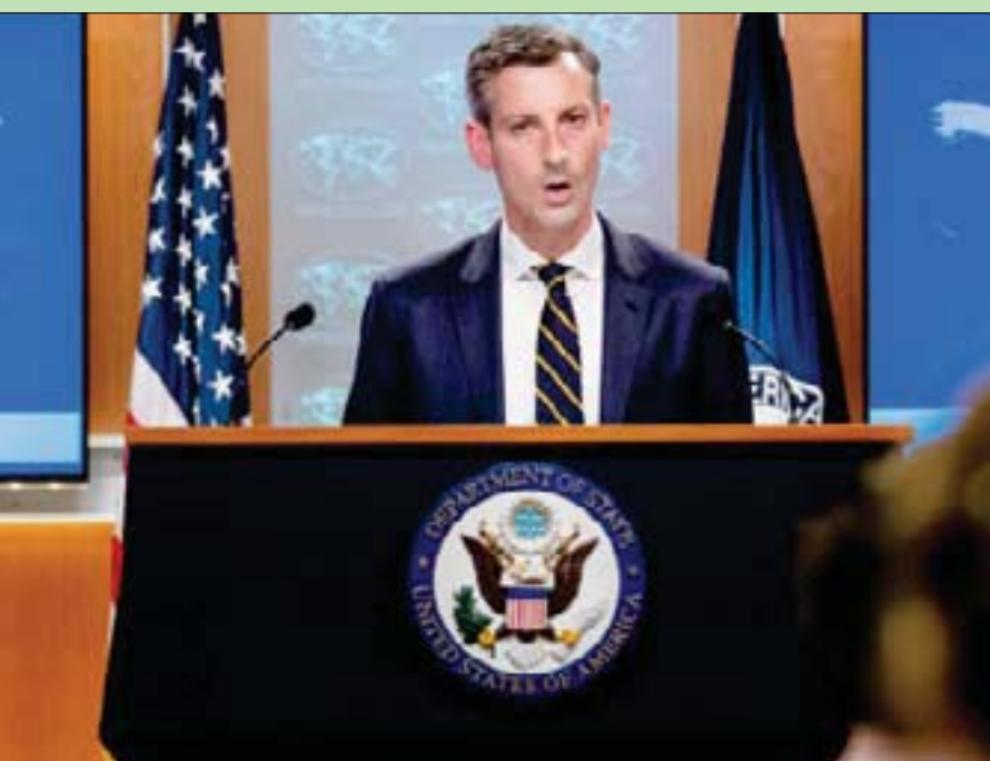
نيد برايس المتحدث الرسمي باسم وزارة الخارجية الأمريكية

وعرضاً لوقف إطلاق النار قدمته السعودية، فإن من الممكن أن ينهي إراقة الدماء لولا التعتن الحوثي