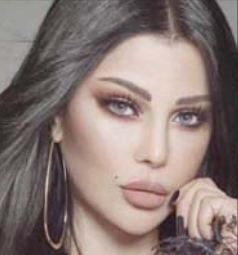
هيفاء وهبي أول من علّق على الموضوع