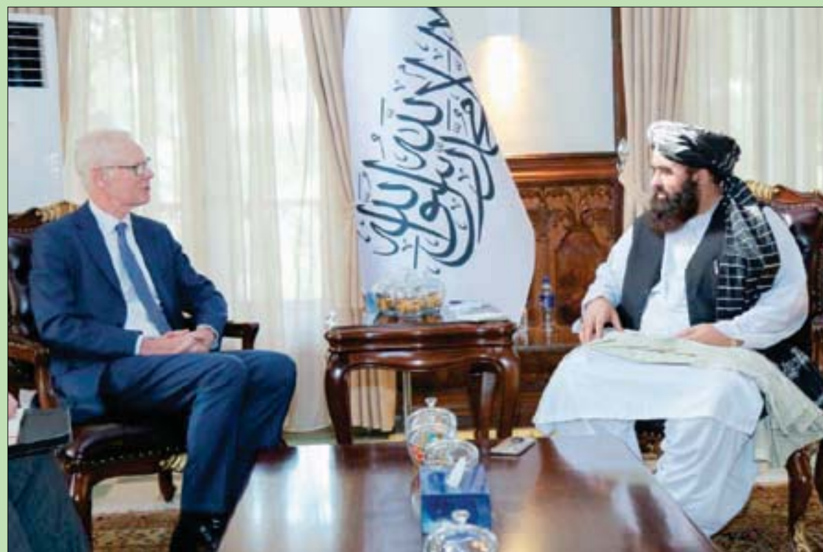
محادثة بين لندن وطهران

المبعوث البريطاني إلى أفغانستان سايمون غاس، لدى اجتماعه مع وزير خارجية حكومة «طالبان» بالوكالة أمير خان متقي، في كابل أمس. والتقى غاس مع مسؤولين آخرين في «طالبان»، وجرى بحث كيفية مساعدة أفغانستان على إدارة الأزمة الإنسانية ومسألة الإرهاب والحاجة إلى إقامة ممر آمن للراغبين في مغادرة البلاد. (تفاصيل ص10)