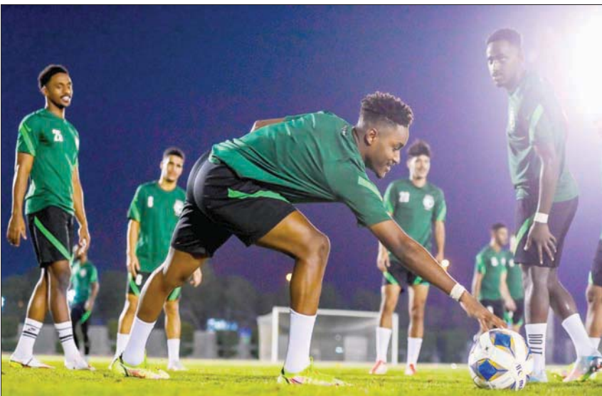
لاعبو الأخضر الأولمبي خلال تدريبات أمس