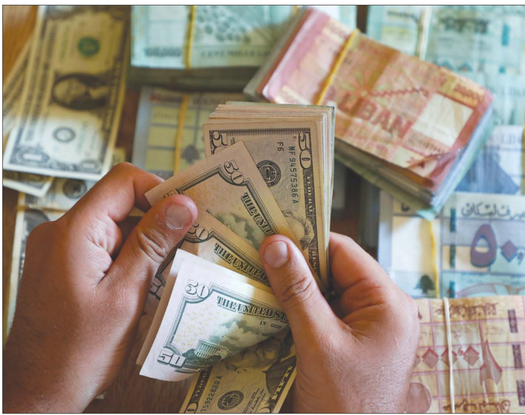
ترجح مؤسسات مالية دولية أن يتراوح سعر الصرف ما بين 8 و10 آلاف ليرة لبنانية مقابل الدولار

أو عبر حملة لمكافحة الفساد، شددت على وجوب شمولية خطة الإنقاذ بحيث تتضمن الإصلاح المالي لجهة حل مشكلة الكهرباء وتوسيع قاعدة المداخل والإقطاع مع الشفقات، والإصلاح النقدي الصرف، والإصلاح الاقتصادي عبر تحديث نموذج لبنان الاقتصادي من خلال تعزيز القدرة التنافسية الدولية للبلاد وتطوير الصادرات، والإصلاح السياسي القائم خصوصاً على تفعيل الحاسبة ومكافحة الفساد. ومع التحوين أن برنامج صندوق النقد الدولي يعد ضرورة في ظل الأزمات الاقتصادية التي تعصف بلبنان، حذرت المؤسسة المالية الدولية بان الاستحصال على مساعدة صندوق النقد الدولي لن يكون نزهة، بحيث سيحد تدخل الصندوق من قدرة الحكومة على التوفيق بين الاحتياجات المتناقضة لشركائها المحليين بالإضافة إلى قدرتها على تأجيل أو التخفيف من الإجراءات المقترحة. وبذلك على الحكومة اللبنانية أن تجربن قدرتها على تطبيق الإصلاحات: خاصة أن إدارة الصندوق ستطلب حل مسألة خسائر القطاع المالي قبل الموافقة على أي اتفاق مع الحكومة. وتكتسب اتفاقية البرنامج مع الصندوق أهمية فائقة بذاتها أساساً وكونها تشكل دمجاً لتأمين تمويل إضافي ولا سيما منه المتعلق بمؤتمر «سيدرا»، علماً بأن هذا التمويل سيكون مرتبطاً بالضرورة بتطبيق الإصلاحات ولن يكون له أثر ملحوظ مباشر على ميزان المدفوعات بما أن التمويل سيكون على صعيد كل مشروع على حدة، إنما سينعكس إيجاباً على صعيد الموازنة لجهة خفض النفقات الاستثمارية.