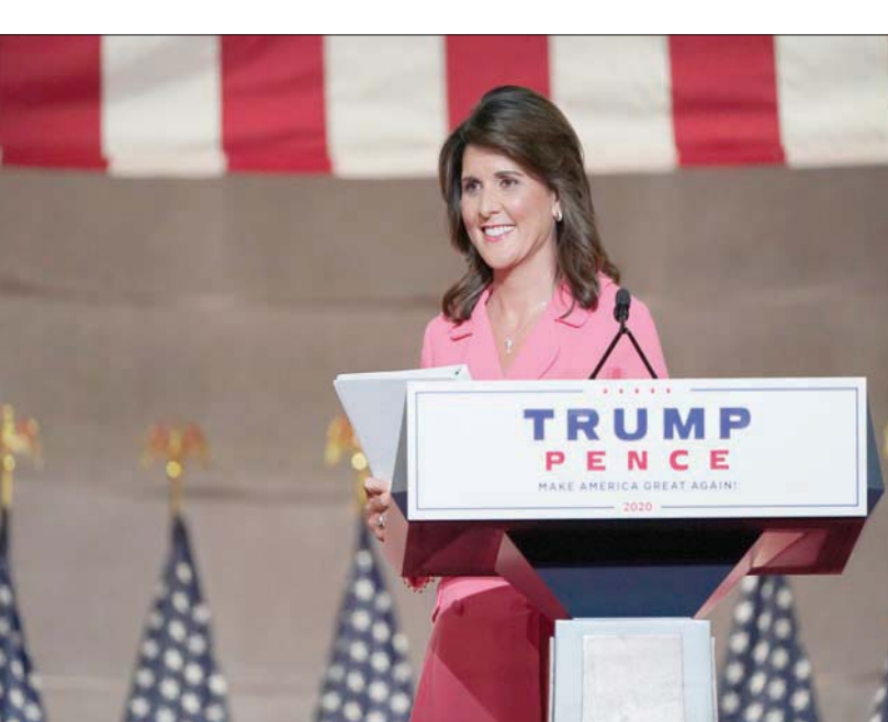
نيكي هايلي تتواصل بشكل دائم مع ترمب بشأن الانتخابات المقبلة