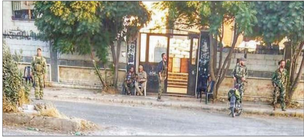
عناصر من قوات النظام السوري في مدينة جاسم جنوب البلاد (درعا 24)

وتشدد على أن أي «تغيير يحدث على المشهد يعود الفضل فيه لانتصار سوريا بمساعدة حلفائنا على المشروع الأميركي الموجه للمنطقة ككل خدمة لمصالح إسرائيل». ووصف تحسين العلاقات بين دول المنطقة بالنسبة الإيجابي، لافتاً إلى أن «سوريا تتطلع لأن تكون العلاقات مع الدول العربية بأفضل حال لأن هذا يعزز أوراق القوة لديها».