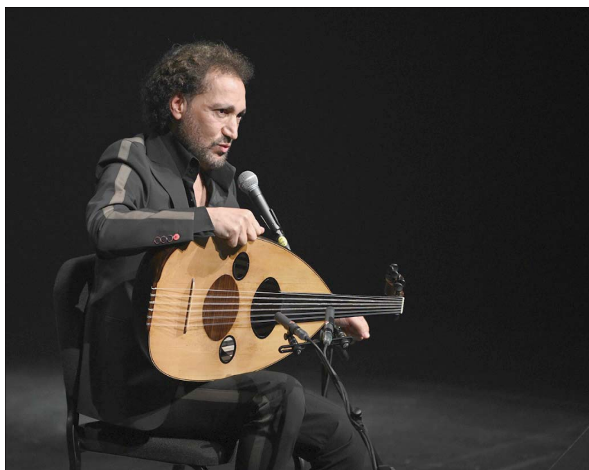
نصير شمة في حفلة أقيمت بالظهران السعودية

● لماذا لا تنسى ليلة لا تنسى - لديك توقيع كتاب... وحلة مع ثلاثي برشلونة... ماذا تخبر عننا؟ - أريد أولاً أن أقول إن وجود العراق كـ «صيف شرف» في معرض الرياض الدولي للكتاب هذا العام، هو تشييد حقيقي لبداية جديدة لشعبنا ومحبة الناس واهتمام المثقفين والقراء بالآجنحة العراقية المنشورة داخل المعرض هو اهتمام حقيقي، وهناك حشود من الناس تقفني الإصدارات من الدور العراقية، وأنا سعيد أن أوقع غداً الخميس 7 أكتوبر (تشرين الأول) الحالي، كتابي «الألسنة» الصادر عن دار «إصدارات» المترجم هذا الكتاب من اللغة العربية إلى اللغة العربية لأربع لغات. وكما تعلمون، لدي حفل موسيقي هذا المساء في مسرح جامعة الأميرة نورة، وهو الحفل الذي يضم ثلاثي برشلونة وهم من أهم العازفين من إسبانيا على الغيتار، وهو عرض جديد اشتغلنا عليه كثيراً، ويسرني أن أقدمه لجمهور متذوق جاء من أرجاء المملكة، وأتمنى أن أقدم لهم ليلة لا تنسى.