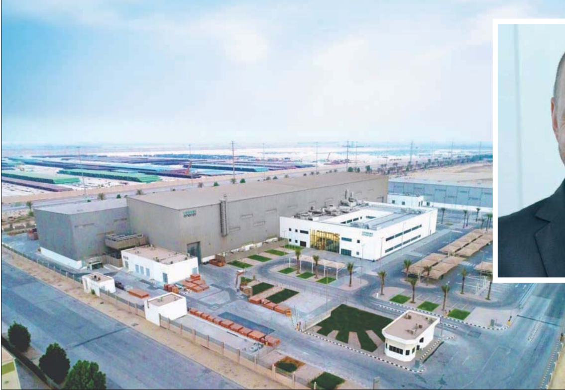
مقر مركز أعمال شركة سيمنس في مدينة الدمام بالسعودية... وفي الإطار رئيس الشركة الدكتور كريستيان بروخ

إن هذه المنطقة تتمتع بإمكانات هائلة للطاقة المتجددة، والمتنقلة في طاقة الرياح والطاقة الشمسية. لذلك، فإن استغلال هذه الطاقة المتجددة سيجعل للمملكة مكانة رائدة في هذا المجال. لقد بدأت المملكة بالفعل في الاستفادة من إمكانياتها عبر إطلاق كثير من المشروعات، مثل مشروع محطة الطاقة الشمسية الكهروضوئية بقدرة 300 ميغاواط في منطقة الجوف الشمالية، الذي تم افتتاحه هذا العام. واعتقد أن هذه مجرد البداية فقط.