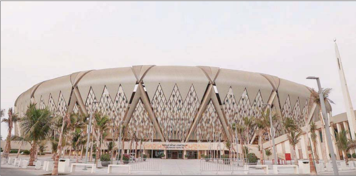
مباراة السعودية وفيتنام حظيت بحضور جماهيري بلغ 40% من سعة استيعاب ملعب مرسلوب بارك (الشرق الأوسط)