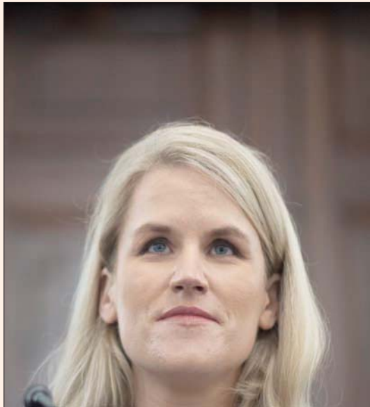
فرانسيس هاوغن «مسربة فيسبوك» خلال مثولها أمام الكونغرس أمس