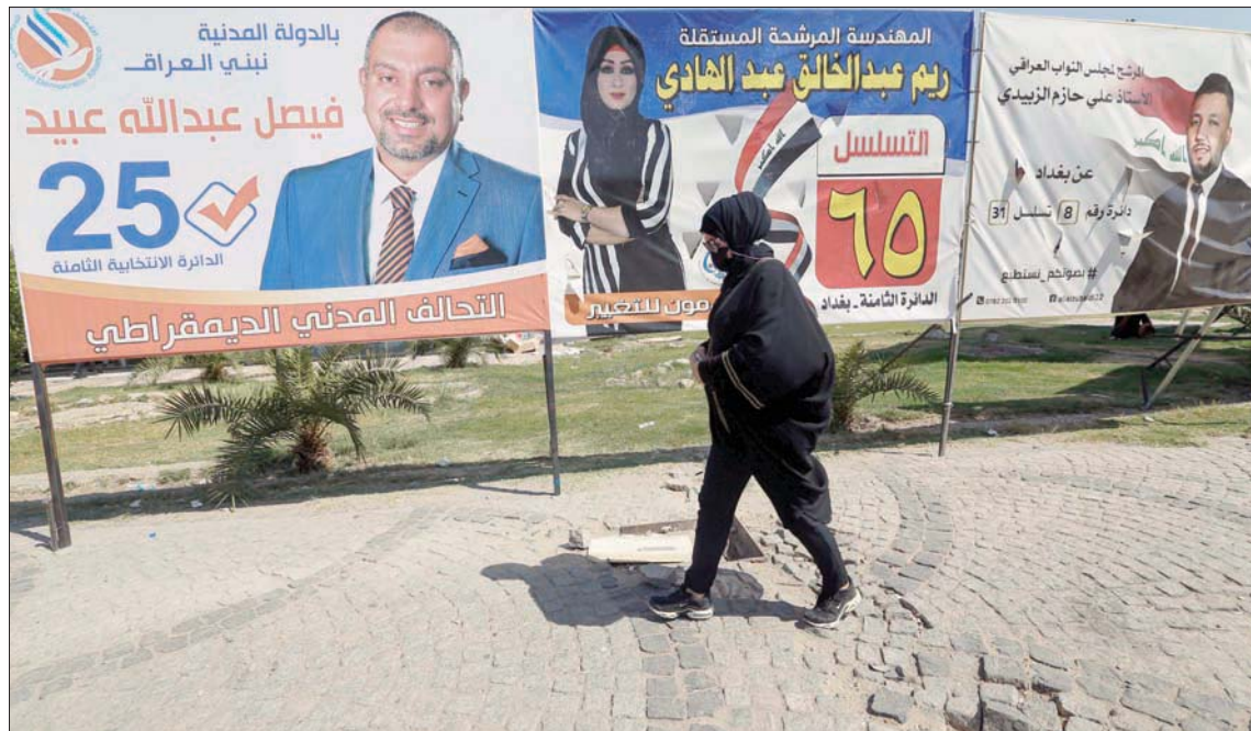
عراقية تمر أمام ملصقات انتخابية في بغداد أمس