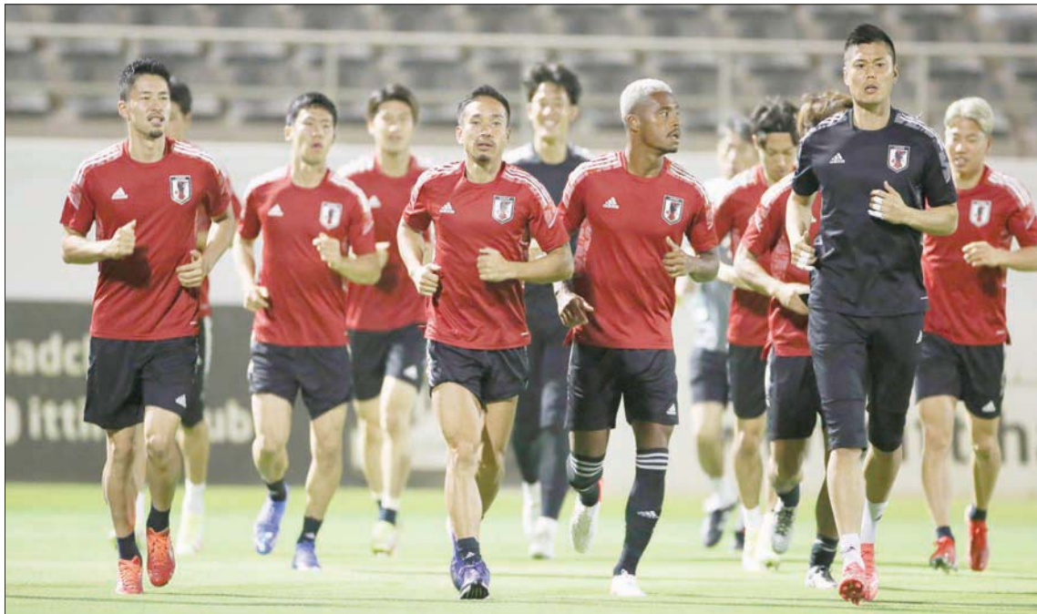
جانب من تدريبات منتخب اليابان أمس في جدة