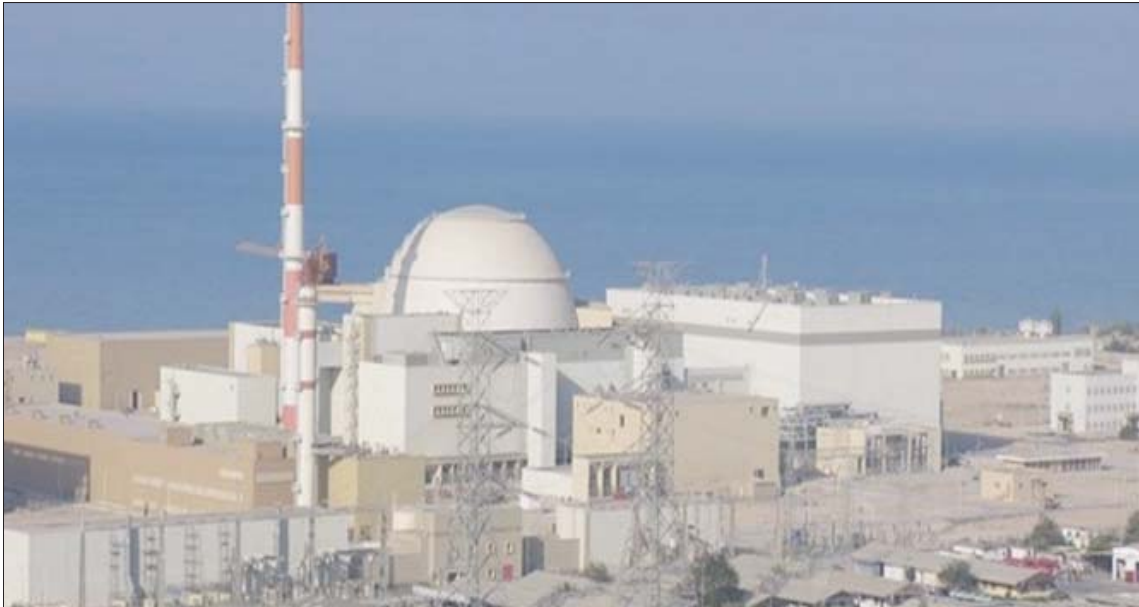
محطة بوشهر النووية الإيرانية (فارس)

وقال إن «التصريحات الإسرائيلية المتكررة حول هجمات ضد أهداف إيرانية، والتباهي بها، تستدرج إيران إلى تنفيذ هجمات مضادة ضد أهداف إسرائيلية. وقد برزت هذه التهديدات، أمس وأول من