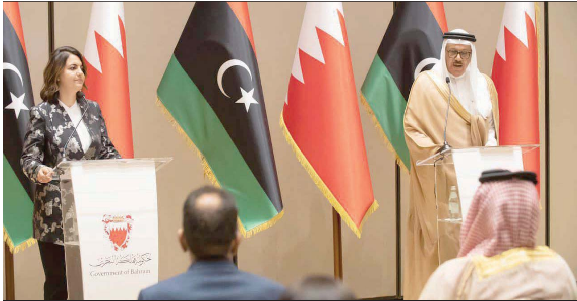
نجلاء المنقوش في مؤتمر صحفي مع نظيرها البحريني الدكتور عبد اللطيف بن راشد الزياني

ظل عدم توافق الأطراف السياسية على خريطة طريق نهائية لإجراء الانتخابات الرئاسية والنيابية المرتقبة، وما إذا كانت ستجري في توقيت واحد، أم على مرحلتين. وتضمن اتفاق اللجنة العسكرية المشتركة في جنيف، الموقع في 23 أكتوبر 2020، الاتفاق على الوقف الفوري لإطلاق النار، وإخلاء جميع خطوط التماس من الوحدات العسكرية والمجموعات المسلحة بإعادتها إلى معسكراتها، بالتزامن مع خروج جميع المرتزقة والمقاتلين الأجانب من الأراضي الليبية، برا وبحراً وجواً.