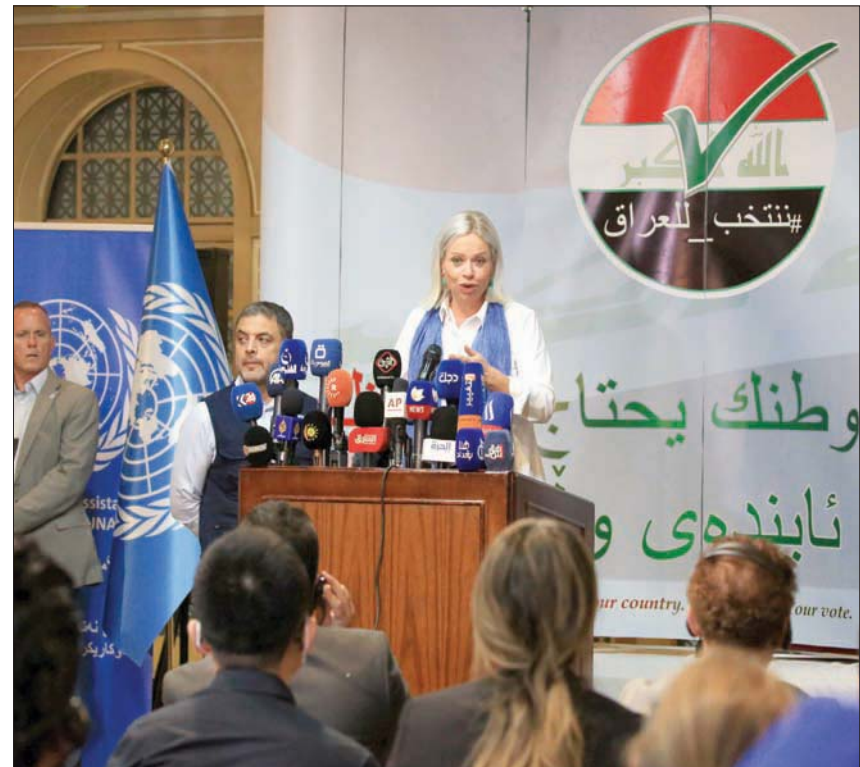
المبعوثة الأممية جينين بلاسخرات تتحدث في مؤتمر صحفي في بغداد أمس

بالمصادقة على الانتخابات». وتسمى حكومة رئيس الوزراء مصطفى الكاظمي ومفوضية الانتخابات والبعثة على طمانة الناخبين العراقيين بشأن قضايا التزوير والتلاعب التي حدثت في أغلب الدورات البرلمانية السابقة،