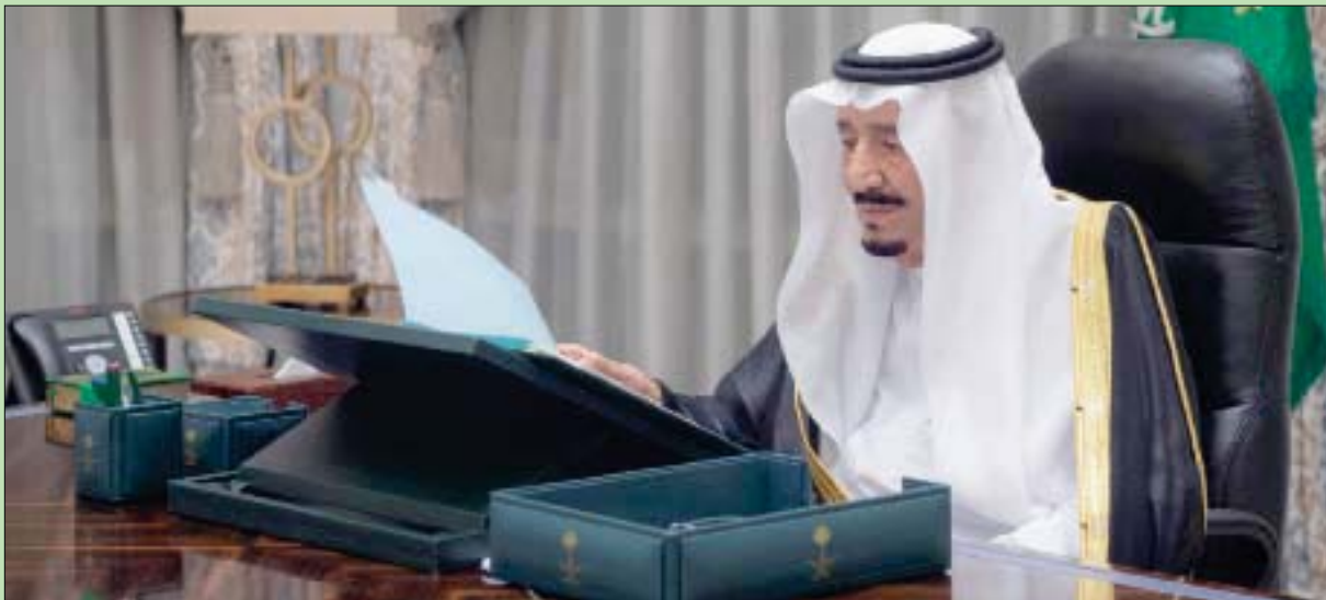
خادم الحرمين الشريفين لدى ترؤسه الجلسة الرئسية لمجلس الوزراء