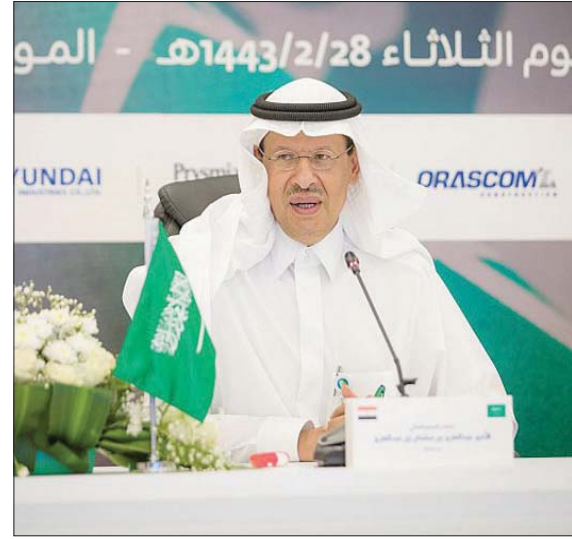
وزير الطاقة السعودي خلال الفعالية

بحضور الأمير عبد العزيز بن سلمان وزير الطاقة السعودي، ووزير الكهرباء والطاقة المتجددة في مصر الدكتور محمد شاكر، والدكتورة رانيا المشاط، وقعت الشركة السعودية للكهرباء، وشركة نقل الكهرباء المصرية، عقود ترسية مشروع الربط الكهربائي بين السعودية ومصر. وقال الأمير عبد العزيز بن سلمان إن الوصول إلى هذه المرحلة المهمة من المشروع هو تنفيذ مذكرة التفاهم في مجال الربط الكهربائي بين البلدين التي وقعت بحضور خادم الحرمين الشريفين الملك سلمان بن عبد العزيز، وولي عهده الأمير محمد بن سلمان، والرئيس عبد الفتاح السيسي، ضمن حزمة من الاتفاقيات الاقتصادية والتنموية والسياسية بين البلدين. وإلى تفاصيل ترسية المشروع: