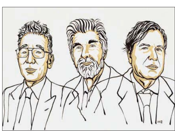
العلماء الثلاثة الفائزون بنوبل في الفيزياء (إدارة الجائزة)

عدد هائل من المكونات أو قد تكون محكومة بالصدفة، ويمكن أن تكون أيضا فوضوية، مثل الطقس، حيث تؤدي الاضطرابات الصغيرة في القيم الأولية إلى اختلافات كبيرة في مرحلة لاحقة، وساهم جميع الفائزين على جائزة هذا العام في اكتسابنا معرفة أكبر بمثل هذه الأنظمة وتطورها على المدى الطويل. وأحد الأنظمة المعقدة ذات الأهمية الحيوية للبشرية هو مناخ الأرض، وأظهر سيوكورو مانابي كيف أن زيادة مستويات ثاني أكسيد الكربون في الغلاف الجوي تؤدي إلى زيادة درجات الحرارة على سطح الأرض، وقاد في الستينات تطوير النماذج الفيزيائية لمناخ