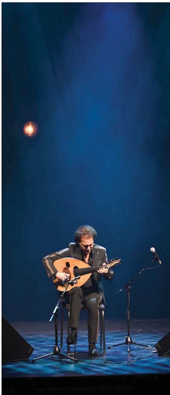
نصير شمة يفتتح الحفل الموسيقي في جامعة نورة

● أعضاء زرياب للعود وترأ خاسماً، وظل يخلق في فضاء الحالمين حتى استقر بين يديك فأضفت إليه الوتر الثامن، فأطلق مساحة الإبداع في التلحين والتأليف، والموسيقى... كيف عثرت على سر زرياب، وقد سمعوك قبل 30 عاماً بزرياب الصغير؟ - زرياب حالة وحضارة متقلبة، فهو قدم للإنسانية غير الموسيقى؛ سوى عن الموسيقى قدم الحضرة وعلم الأتيكيت، والأزياء، والعمارة، وصالونات ومخنومة بختم الخليفة أعدها وزرياب في الأندلس، وبالتالي، فزرياب هو حضارة متقلبة، وعندما كنت في سن 14 سنة أطلق الفرنسيون علي «زرياب الصغير» بسبب تأثيرنا على الجمهور في حفلة أقيمت هناك، هذا الوصف ينهني إلى خطورة ما نملك، وأهمية ما يجب أن نكون عليه، وهذه التسمية لم تكن تعرفني أو تحزني لاني وقتها لم أكن أعرف هذا التاريخ، ولكننا لغت انتباهي إلى أنه يجب أن أقرأ