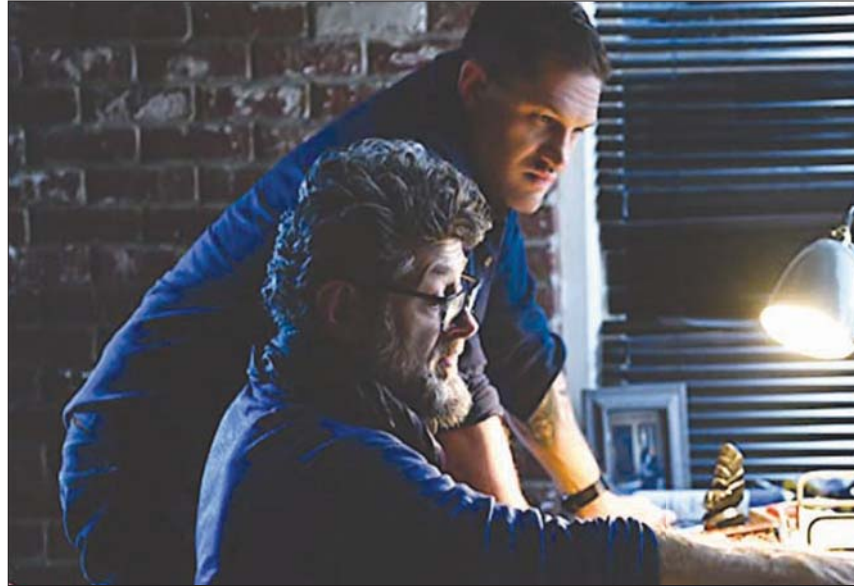
المخرج أندي سركيس مع بطل «فينوم» توم هاردي

الصرع الحقيقي هو بين شركة «مارفل» المنتظمة بالكامل لشركة «ديزني» وبين مالكي الحقوق السابقين لشخصيات و من ألقت إليهم تلك الحقوق ترى «ديزني» حساب كل الأسواق التي سيتم إطلاق الفيلم فيها بدءاً من نهاية الأسبوع المقبل ومن بينها السوق الأمريكية ذاتها.