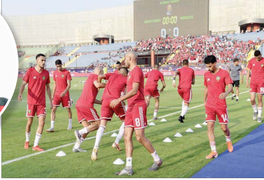
لاعبو المغرب خلال التدريبات استعداداً لجولة التصفيات الأفريقية

الصادرة والحفاظ على حظوظه في حجز بطاقة المجموعة في منافسته المثيرة مع بوركينفا فاسو ضيفته في الجولة البداية القوية والاقتراب أكثر من الدور النهائي بتصميم وإدارة ضيفته موريتانيا الساعة إلى فوزها الأول في الدور الثاني.