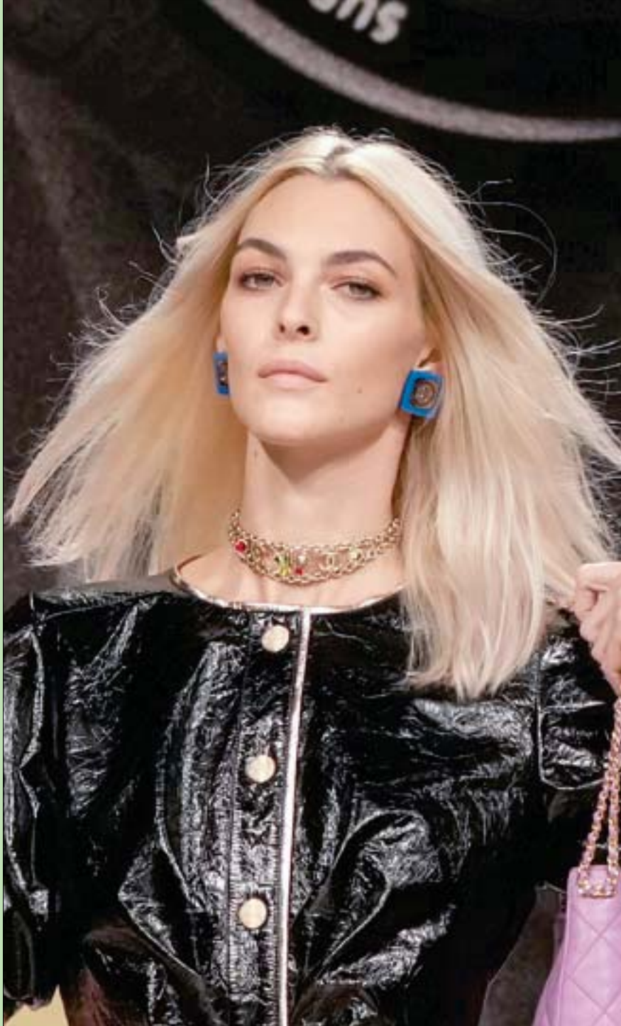
عارضة ترتدي زيأ من عرض دار شانيل للأزياء الجاهزة لربيع وصيف 2022 في باريس أمس

يوجد حل، بل حلول، لكن هل كنا نحتاج لمثل هذه الصفعة من «فيسبوك» لننهى غفوة النعاس؟