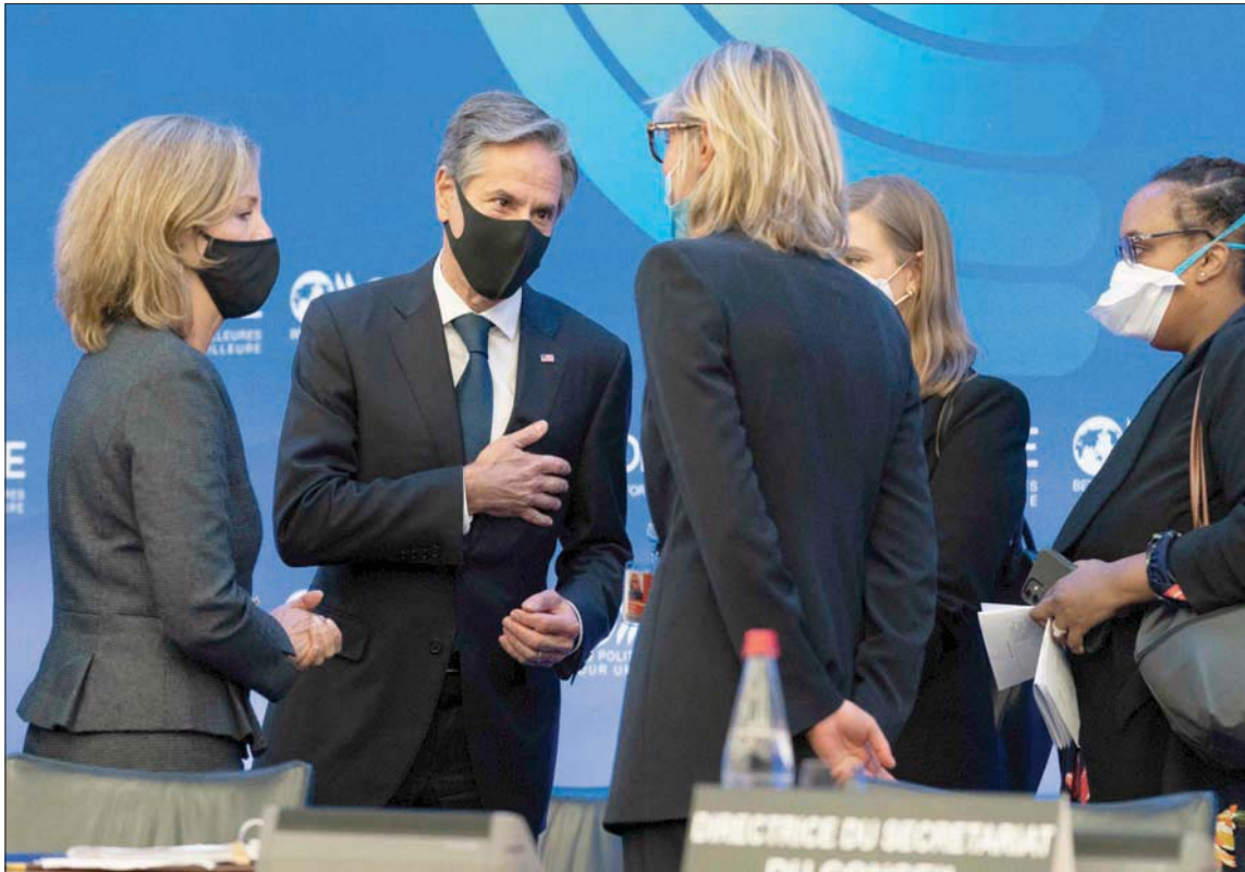
الوزير بلينكن لدى وصوله لحضور اجتماع منظمة التعاون الاقتصادي والتنمية في باريس أمس