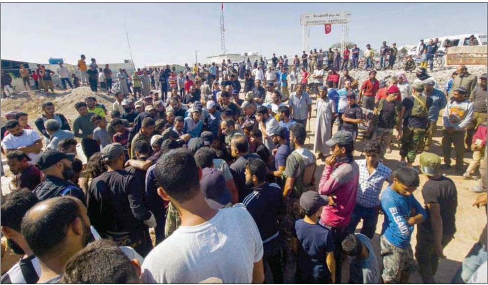
تشبيح عناصر قتلوا بغارة روسية في ريف حلب شمال سوريا في 26 الشهر الماضي

فإن «الطائرة الانحرارية» هبطت بمظلة، وهي المرة الأولى التي يتم استخدام هذا النوع من السلاح الجديد.