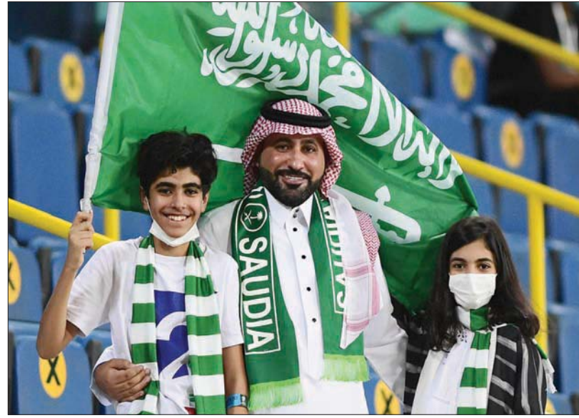
بإمكان المشجعين إحضار أبنائهم من سن 12 عاماً فما فوق بشرط حصولهم على جرعتي