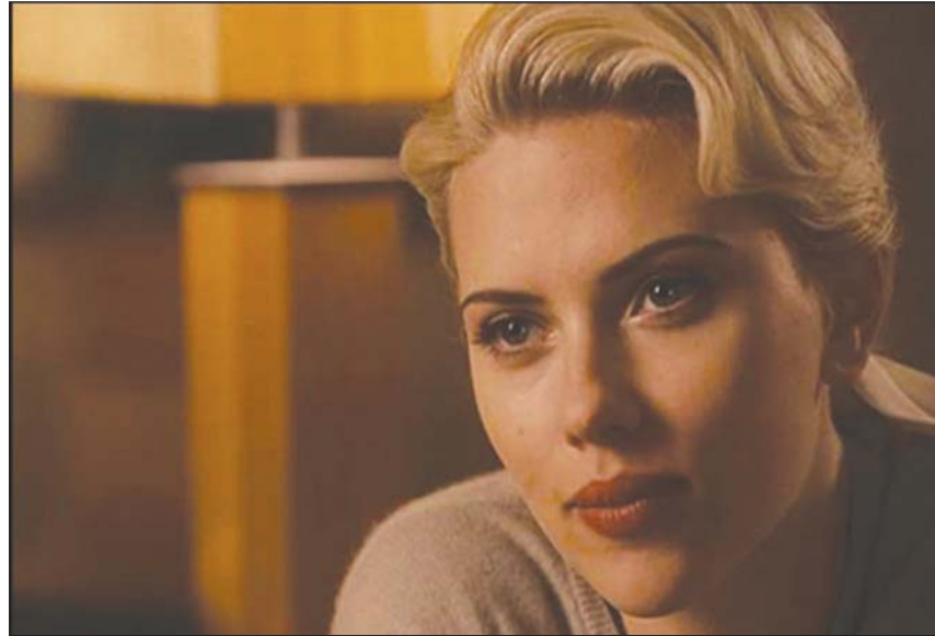
سكارلت جوهانسن... حل خلفها مع «ديزني» خارج المحكمة