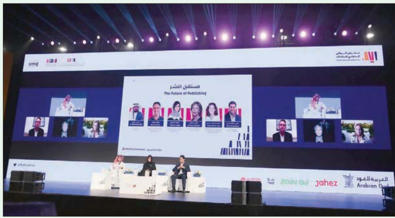
جانين من جلسات مؤتمر الناشرين أمس

المعدة في سلاسل الموارد والتوزيع». وأضاف: «على المستوى الشخصي، أعتقد أن الترجمة النشر أصبحت معقدة جداً، آثار كبيرة على صناعتنا في المستقبل». من جهتها، قالت لورين شالني، إن صناعة النشر أصبحت معقدة جداً، والمتأثر على نتائج أمور محورية، مثل التوزيع والتسويق والتعليم وثقافة المستهلك كذلك. وأوصت بالتعلم العميق ومتابعة التطورات الجديدة، وكل ما يتعلق بالحقوق ومعاصرة البحث، وهي هموم متغيرة تعيشها اليوم كما تقول.