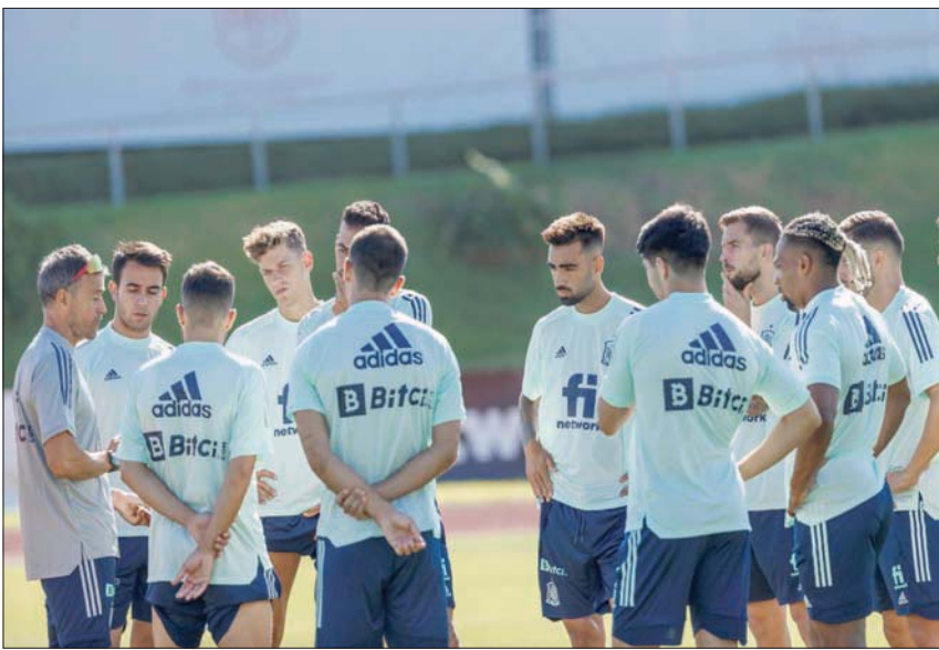
إنريكي مدرب إسبانيا (يسار) يوجه لاعبيه قبل اللقاء المرتقب ضد إيطاليا

يسعى إليه طاقمنا التدريبي من حيث الطريقة التي يجب أن تلعب بها إسبانيا، فإن الأولى ستكون الهجوم، والثانية الضغط، والثالثة الطموح». وأضاف: «الكلمة الأهم هي الهجوم؛ لماذا؟ عندما نحلس لاختيار فريق، فإن أول شيء ننظر إليه هو ما يمكن أن يقدمه في الهجوم، سيكون لدى كل لاعب القدرة على الدفاع لتحقيق التوازن في هذا الأمر (الناحية الدفاعية)، لكن النوع الذي يجب أن يكون عليه لاعبو خط الوسط وقلبا الدفاع والظهيران هو المساهمة الهجومية الفعالة. يجب أن يتمتعوا بفتيات جيدة من أجل محاولة إخراج الكرة من الخلف حتى تصل إلى مهاجمينا بأفضل طريقة ممكنة».