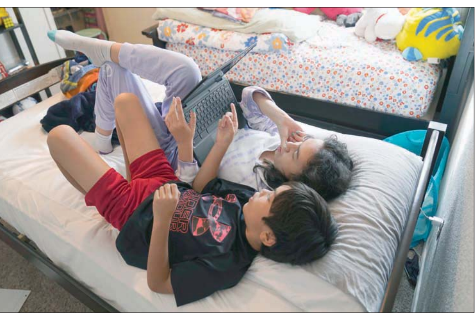
يونيسيف: تأثير فترة «كورونا» على الصحة العقلية لدى الأطفال قد تستمر سنوات (أب)

ويصل بذلك إجمالي الإصابات بالفيروس في البلاد إلى 33 مليوناً و853 ألفاً و48 حالة. ونقلت صحيفة «هندستان تايمز» عن الوزارة القول إنه تم تسجيل 263 حالة وفاة بالفيروس، ليبلغ إجمالي حالات الوفاة 449 ألفاً و260 حالة. وأعيد فتح المدارس في مومباي، المركز المالي للهند، والمناطق المحيطة