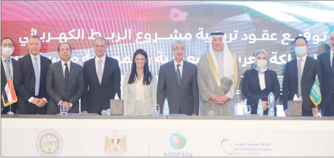
جانب من توقيع عقود ترسية مشروع الربط الكهربائي في الرياض والقاهرة بالتزامن

لربط عربي مشترك، بالإضافة إلى أنه يأتي مكملاً وواعماً لرؤيتي كلا البلدين.