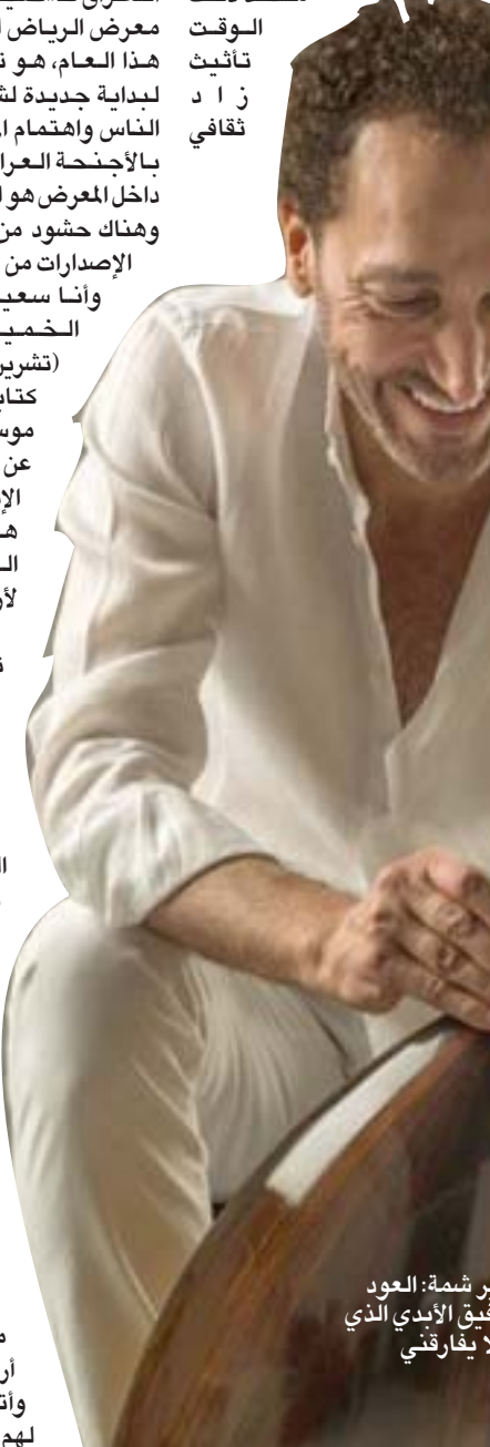
نصير شمة: العود هو الرقيق الأبدى الذي لا يفارقتي

● علاقتي مع العود تمتد على مسافة عمرية كاملاً ● العود هو سجل لذاكرة وسجل لروح وسجل لثقافة وسجل لقلب ولقصص عشق وأخرى مؤلمة، أمل، العود شكل بانوراما لكل ما مررت به ومرت به شعوبنا العربية. ● عرف العراق أول آلة موسيقية في الحضارة الإنسانية، وعرفت بغداد الفن والموسيقى منذ حضارات سومر وبابل وأشور، وترجع إليها قبارة أور؛ أقدم آلة موسيقية عرفتها البشرية، بلاد إسحاق الموصلي، وتلميذه (زرياب)... هل يشك هذا الامتداد الحضاري وأنت تعرف العود... ماذا يعني لك هذا الإرث العظيم؟