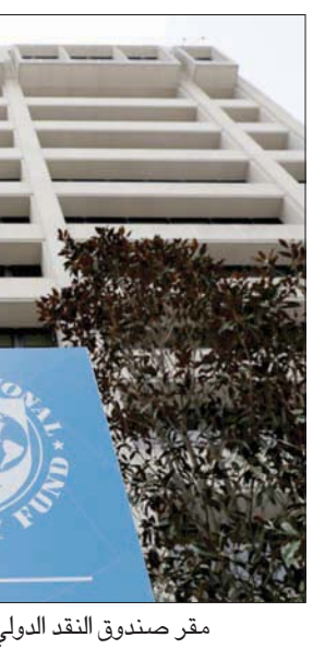
مقر صندوق النقد الدولي في واشنطن

ولفت إلى أن ميقاتي نأى بنفسه عن الانجرار إلى سجال مع عون لأن ما يهيم الوصول إلى النتائج المرجوة من التفاوض مع صندوق النقد الدولي، وهذا ما عكسه في مداخلة أمام الوزراء الذين اعترفوا بأنه تجنب القيام بأي رد فعل وحرص على ضبط إيقاع الجلسة لأن ما يهيم هو النتائج، كما يترتب من مفاعيل سلبية على الحكومة من قبل المجتمع الدولي الذي يبدي استعداده لمساعدة لبنان.