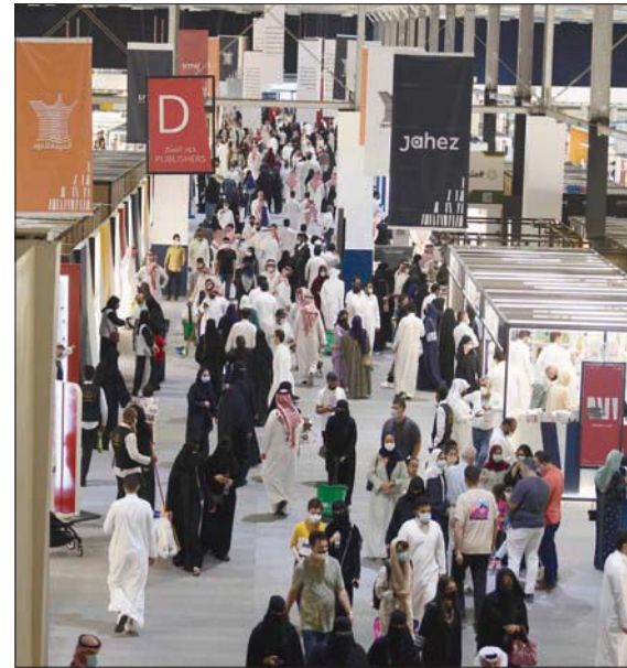
أزدهم المعرض بجمهور المتعشقين للاطلاع