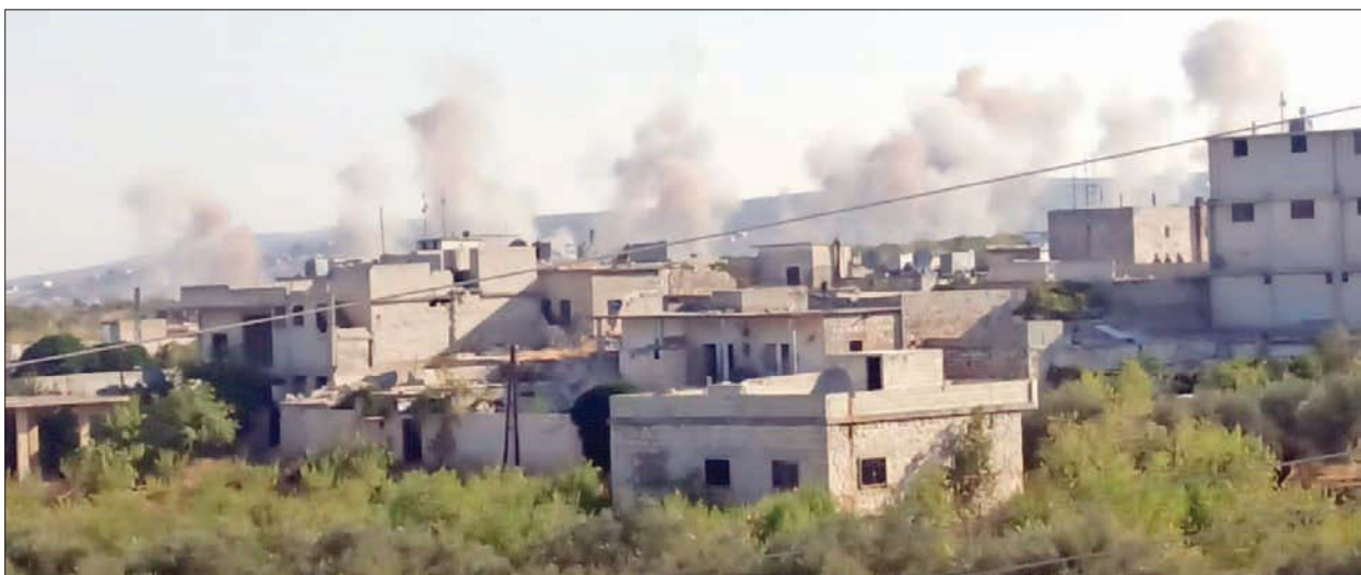
دخان يتصاعد من أحسم جنوب إدلب بعد قصف عنيف أمس

تجدد القصف، بالتزامن مع تحليق مكثف لطائرات استطلاع روسية في أجواء محافظة إدلب. وقال مصدر عسكري في فصائل المعارضة، إن «هناك ثمة مؤشرات على الأرض تخالف من سُرْب أو نُقْل عن الرئيسين التركي ورجب طيب أردوغان ونظيره الروسي فلاديمير بوتين، عقب عقدهما قمة موسكو يوم الأربعاء الماضي، حول التزامهما الهدئة في إدلب، وما قيل عن إبقاء الوضع كما هو في إدلب»، مشيراً إلى أن «حشوداً عسكرية لقوات النظام ومليشيات مساندة لها وصلت خلال اليومين الماضيين