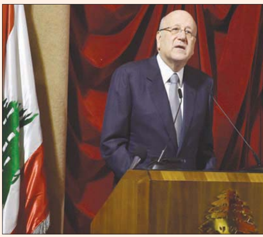
رئيس الوزراء اللبناني