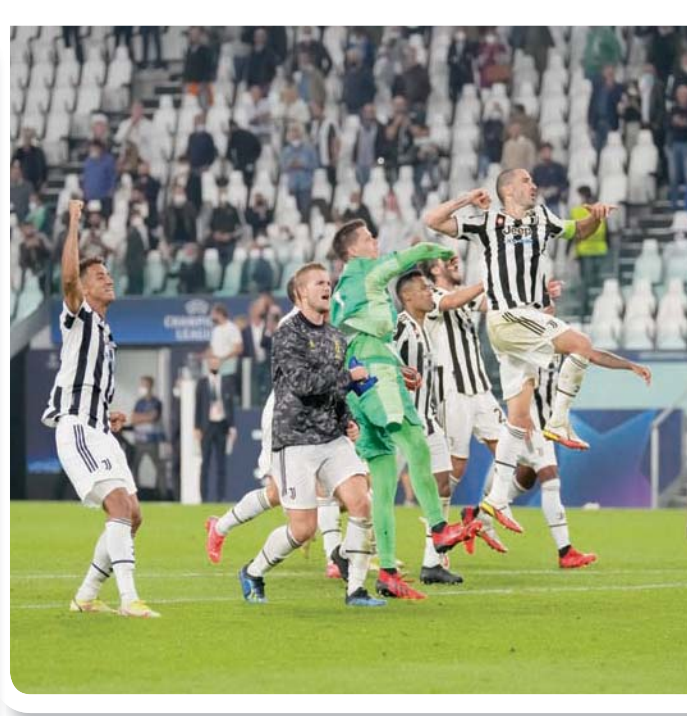
فرحة لاعبي مانشستر سيتي بعد هدف الفوز على تشيلسي

أبدا، وحاول أن تغلق نصف المساحات. ومن حين لآخر، نسمع البعض في فقرات التحليل للمباريات على شاشات التلفزيون، وفي كثير من الأحيان على منابر الحمقى على وسائل التواصل الاجتماعي، يتحدثون عن وجود تناقض بين «التكتيكات