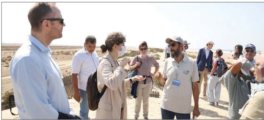
جانب من زيارة المنظمات دولية وسفراء الدول الأوروبية لإطلاعهم على التجربة المصرية في تأهيل الترع (وزارة الري المصرية)

الجسور الشاطئية لحماية المناطق المنخفضة، وإنشاء خطوط طويلة لمصدات الرمال». يأتي هذا في حين تستمر أزمة مفاوضات «سد النهضة».