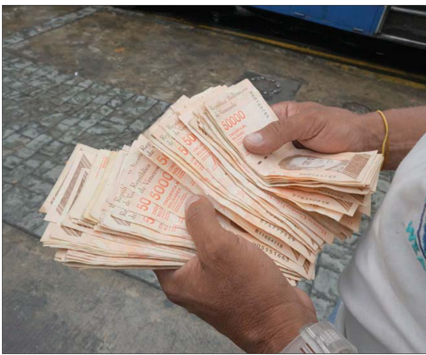
باتت عملة فنزويلا ورقاً بلا قيمة تقريباً مع ارتفاع التضخم المنهال

الرئيس الاشتراكي مادورو والمعارضة بقيادة خوان غوايدو، الذي تعتبره نحو خمسين دولة من بينها الولايات المتحدة رئيساً مؤقتاً للبلاد.