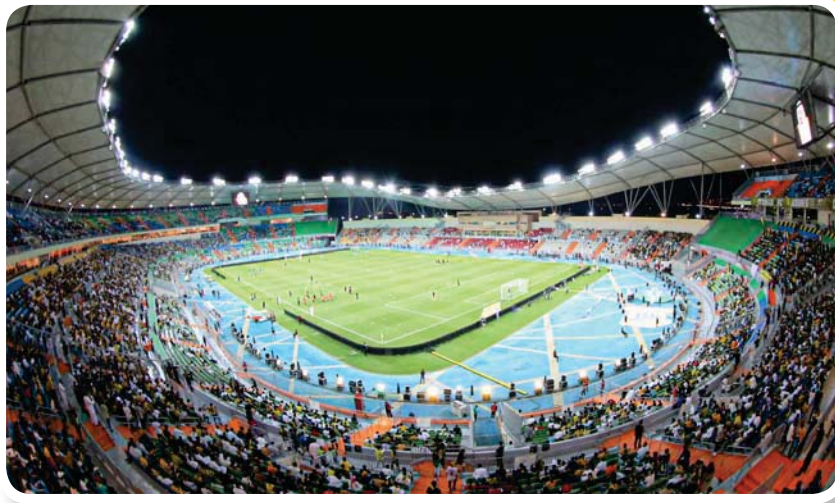
ملعب الأمير عبد الله الفيصل الذي تم تدشينه في أمس بعد غياب 9 أعوام

ويتطلع التعاون هذا المساء لاستغلال إقامة مواجهة على أرضه وبين جماهيره من أجل تحقيق أول فوز له سيمنحه قفزة في لائحة الترتيب ويعيده لحالة معنوية مثالية مع فترة التوقف الحالية، على أن يعود للظهور بصورة أفضل عن السابق مما تبقى من منافسات هذا الموسم.