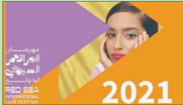
هوليود، محمد رضا

يتابع مهرجان البحر الأحمر المنوي انعقاده ما بين السادس والخامس عشر من ديسمبر (كانون الأول) المقبل، تحضيراته الكثيفة لإطلاق دورته الأولى التي يُعقد عليها الكثير. المهرجان السعودي الذي سيقام وسط احتفال كبير مع عدد من السينمائيين، مخرجين ومنتجين وممثلين، أعلن، في جملة استعداداته، عن عدد من الأفلام العربية والأفريقية التي ستعرض فيما يصلح على تسميته «السوق الأحمر» (Red Souk) الذي سيقام خلال أيام المهرجان (ما بين 8 و11 ديسمبر). بهدف السوق إلى تعزيز الصلة بين السينمائيين المشاركين والجهات الإنتاجية والتوزيعية العربية والعالمية. وقد تم اختيار 12 مشروعاً، ما زالت في مراحل مختلفة من الإنتاج، تبحث عن عمليات دعم وتسويق. هذه الأفلام تنقسم عملياً إلى أربعة أقسام: