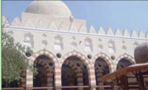
ترميم المسجد تكلف نحو 32,5 مليون دولار

الأولى من مشروع ترميم المسجد الذي يعد واحداً من أجمل مساجد القاهرة، إضافة أثرية وسياحية جديدة للمنطقة، حيث إنه ثمرة تعاون بين الوزارة ومؤسسة الأغاخان للخدمات الثقافية والاتحاد الأوروبي.»