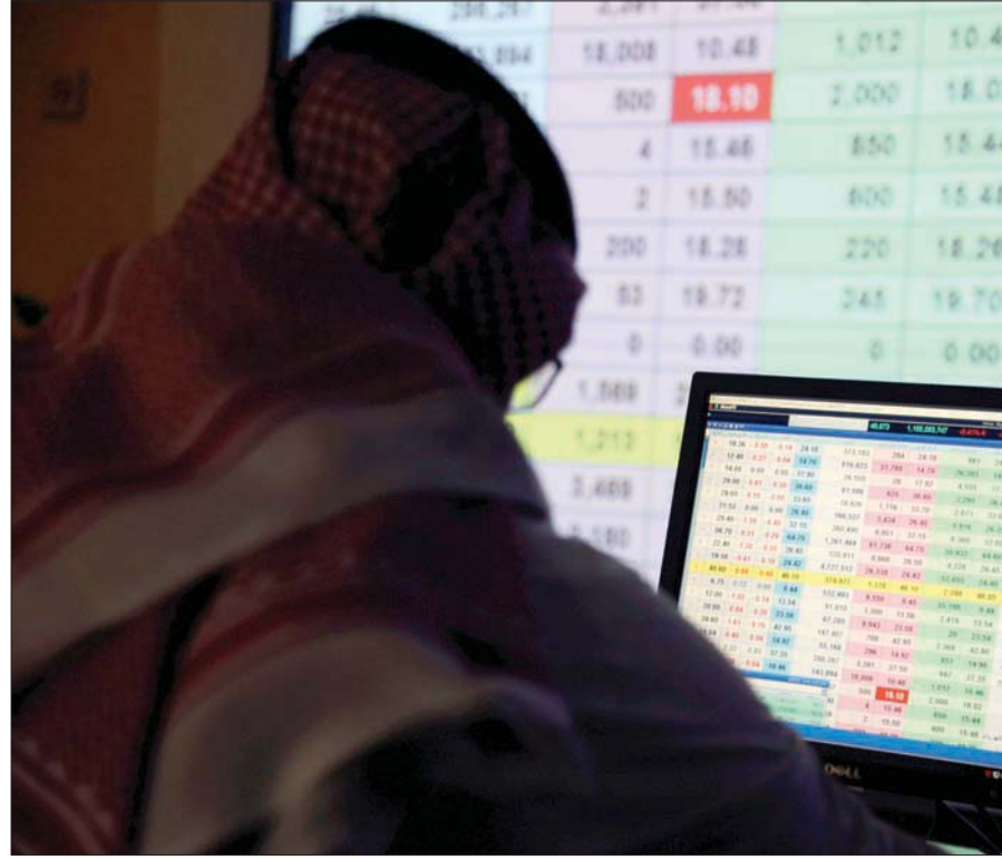
السوق السعودية تدخل ضمن مؤشرات راسل العالمية

واتخذت الهيئة إجراءات عملية خلال الفترة الماضية لتطوير سوق الصكوك وأدوات الدين، من أبرزها إدراج وتداول أدوات الدين الحكومية لجميع فئات المستثمرين في السوق المحلية عام 2018، والسماح للمستثمرين الأجانب بالاستثمار المباشر في أدوات الدين خلال عام 2020، كما جرى خلال العام ذاته إعفاء المصدرين الراغبين في طرح أدوات دين طرحاً عاماً من سداد المقابل