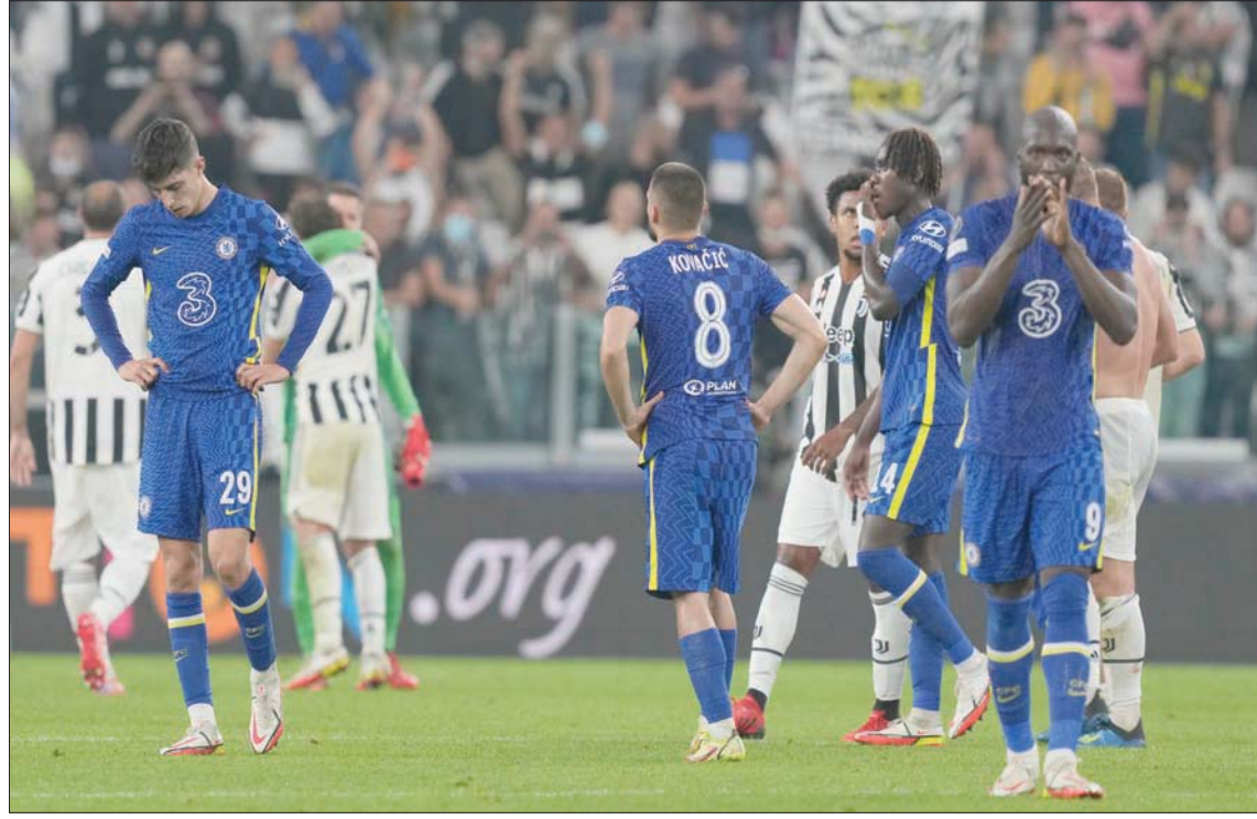
الخسارة على ملعب يوفنتوس عمقت من أزمات تشيلسي بعد الهزيمة أمام مانشستر سيتي

سيتي؟ وهل تشيلسي حقاً فريق ممتاز في الدفاع؟ وهل سيتمكن توخيل من مواصلة النجاح مع تشيلسي بهذا التكتيك الدفاعي؟ ربما يكون أفضل رد على هذا الجدل هو أحد اللاعبين في هذا الموسم، وهو مانشستر سيتي الذي أثبت للجميع تحت قيادة المدير الفني الإسباني جوسيب غوارديولا أن يمكنه الدفاع ببراعة دون أن يوصف بأنه فريق دفاعي. ومن الأمور المحورية في هذا الأمر أيضاً الفلسفة المتمثلة في أن الاستحواذ على الكرة لأطول فترة ممكنة هو في حد ذاته تكتيك دفاعي. وبعبارة أخرى، فإن أفضل طريقة للدفاع هي التاكيد من قيامك بأقل قدر ممكن من الدفاع؛ وعلى النقيض من ذلك، فإن فريق تشيلسي بقيادة توخيل يقوم بالكثير من النواحي الدفاعية. وبالعديد