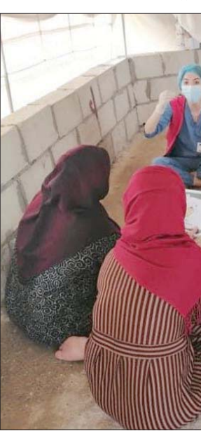
«الهلال الأحمر» الكردي يطلق حملة توعية في مخيم للنازحين شرق الحسكة