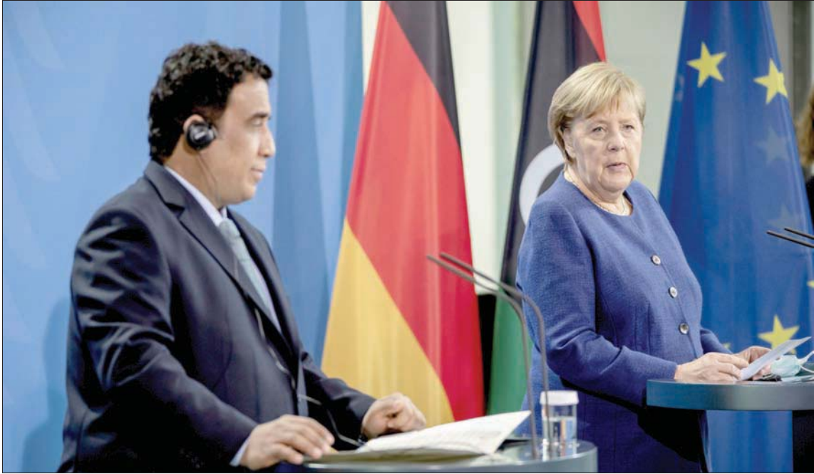
ميركل والمنفي يتحدثان إلى الصحفيين بعد لقائهما في برلين أمس

لمسار الأمم المتحدة وللجهود التي تبذلها المنظمة الدولية، بل يسير على موازاتها. وتهدف ألمانيا إلى السيطرة على عمليات الهجرة غير الشرعية التي تحصل من الشواطئ الليبية باتجاه أوروبا، وهي تعتقد أنها لا يمكنها السيطرة على ذلك من دون وجود حكومة مستقرة موثوق بها في طرابلس. وتتفادى ألمانيا التشديد في ضغوطها على تركيا لسحب قواتها من ليبيا والمرتزقة الذين أرسلتهم، تفضيلاً لأي تصعيد خصوصاً باللاجئين. واثماً ما تهدد تركيا بوقف تعاونها مع أوروبا وفتح الطريق أمام اللاجئين الساعين للوصول إليها.