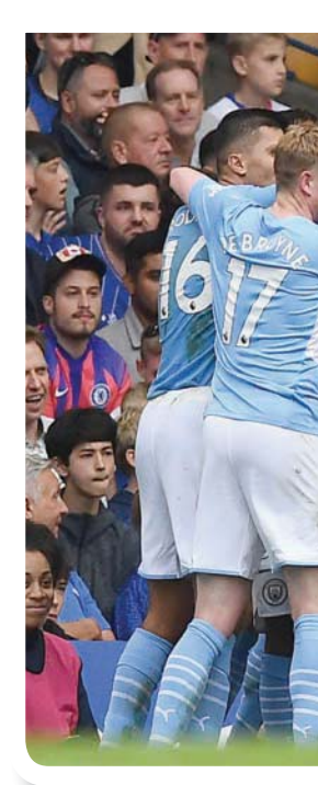
فرحة لاعبي مانشستر سيتي بعد هدف الفوز على تشيلسي

لقد كان من الواضح أن مباراة ريفية المستوى فريقين رفيعي المستوى يقودهما مديران فنيان رفيعا المستوى. وربما تكون هذه هي المفارقة المميزة لكرة القدم الحديثة، حيث يبدو الأمر وكأن الأندية تسعى للتعاقد مع اللاعبين المشاهير أصحاب الأسماء الكبيرة من أجل إرضاء الجمهور ومن أجل المشاركات التي تراها على وسائل التواصل الاجتماعي؛ لكن في الوقت نفسه، ويعيد عن هذا الضجيج، فإن كرة القدم الحديثة هي لعبة بين المديرين الفنيين، ومن المؤكد أن الدوري الإنجليزي الممتاز محظوظ بوجود ثلاثة من أفضل المديرين الفنيين في العالم. ومن المؤكد أن هذه القصة ستواصل وستتطور خلال الأشهر والسنوات القادمة، لكن مباراة مانشستر