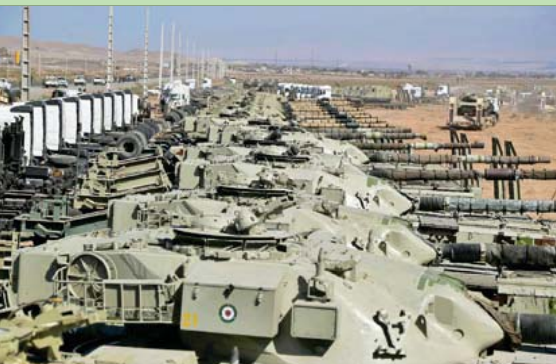
دبابات إيرانية قرب الحدود مع أذربيجان خلال مناورات عسكرية رفعت منسوب التوتر بين البلدين