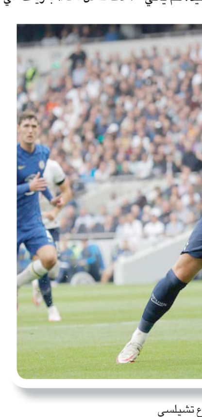
الخضرم تياغو سيلفا لعب دوراً بارزاً في تقوية دفاع تشيلسي

أبدا، وحاول أن تغلق نصف المساحات. ومن حين لآخر، نسمع البعض في فقرات التحليل للمباريات على شاشات التلفزيون، وفي كثير من الأحيان على منابر الحمقى على وسائل التواصل الاجتماعي، يتحدثون عن وجود تناقض بين «التكتيكات