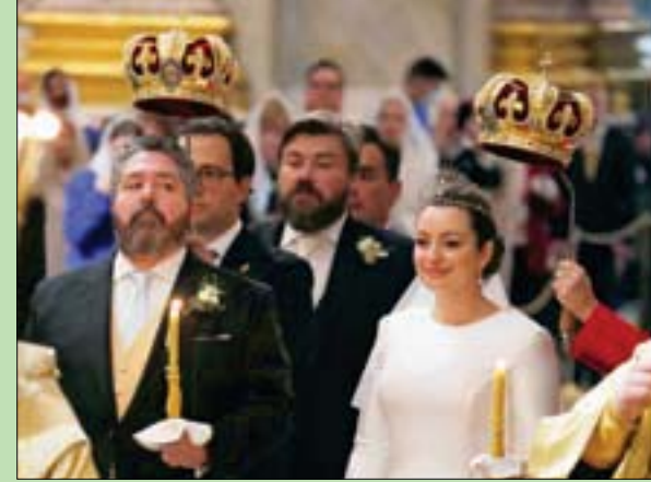
الدوق الكبير غيورغي رومانوف وإلى جواره عروسه الإيطالية فيكتوريا

سان بطرسبرغ (روسيا) «الشرق الأوسط» أقيمت، الجمعة، مراسم زفاف وريث آخر قيصرية روسيا نيقولا الثاني الذي أعدمه البلاشفة مع عائلته عام 1918. وحضر العرس في سانت بطرسبرغ للمرة الأولى منذ الثورة الروسية قبل 104 أعوام عدد من أفراد العائلات الملكية. وعقد الدوق الكبير غيورغي رومانوف (40 عاماً) قرانه على