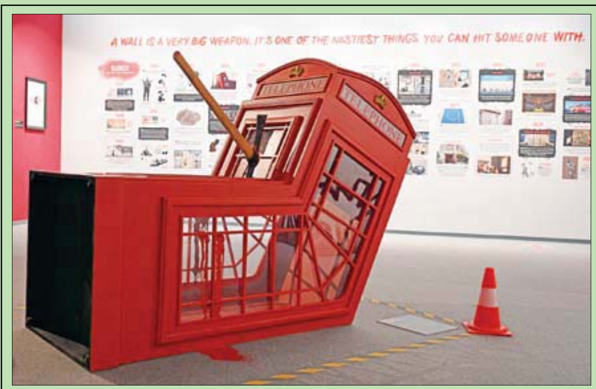
نسخة من «موت كتشك الهاتف» في معرض «غموض بانكسي» وهو المعرض الذي يطوف مدناً ألمانية عدة ويضم 150 نسخة من أعمال فنان الشارع البريطاني الغامض

لوس أنجليس، «الشرق الأوسط» أعلنت الممثلة سكارليت جوهانسون وشركة «ديزني» أنها توصلتا إلى اتفاق بشأن الخلاف المالي الذي نشب بينهما منذ إتاحة عرض فيلم «بلاك ويدو» عبر البث التدفقي بالتزامن مع عرضه في دور السينما، وهو ما اعتبرته النجمة الأميركية مخالفة للعقد. وجوهانسون التي تعتبر من أبرز نجوم هوليوود وأعلامه أجراً، كان يُفترض أن تتقاضى نسبة مئوية من إيرادات شبكات التذاكر من فيلم «مارفل» المرتقب جداً الذي تؤدي فيه الدور الرئيسي، على ما أفاد خص دعوى تقدمت بها في نهاية يوليو (تموز) الفائت إلى محكمة في لوس أنجليس. وأشارت وكالة الصحافة الفرنسية إلى أن جوهانسون