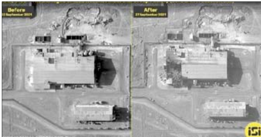
الصورة التي نشرتها شركة «إيمجسات» لمنشأة إنتاج الصواريخ قرب طهران

الصحيفة الإسرائيلية في أوروبا، إنه سال خطيب زاده خلال مشاركته في ندوة ضمن اجتماع لمنتدى