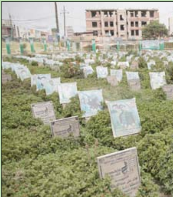
مقبرة في صنعاء توزعت فيها صور عشرات المقاتلين الحوثيين الذين قتلوا في المعارك الأخيرة

معارك وضربات جوية تحصد عشرات الحوثيين جنوب مأرب