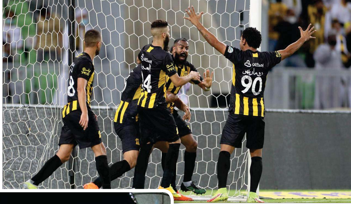
فرحة اتحادية أمس تكررت مرتين في شبكات الأهلي (الشرق الأوسط)

بريدة في صراع البحث عن النقاط الثلاث. ويدخل الدوري السعودي للمحترفين فترة التوقف الثانية هذا الموسم بعد نهاية مواجهة هذا المساء، وذلك بسبب إقامة أيام الفيفا الدولية التي سيخوض فيها الأخضر السعودي مباراتي التصفيات الحاسمة أمام اليابان والصين ضمن منافسات الجولتين الثالثة والرابعة. وعوداً على مواجهة هذا المساء بين التعاون وضييفه الطائي، حيث يتطلع صاحب