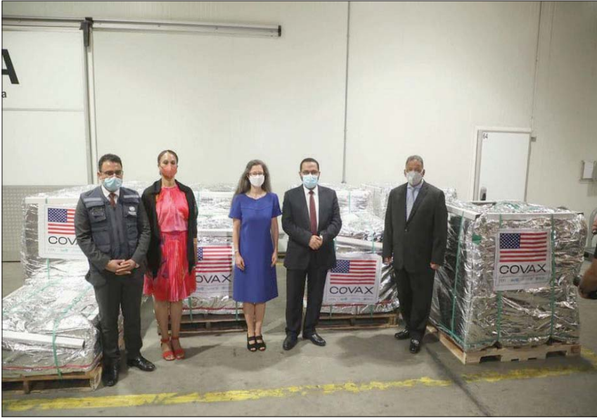
مسؤولون مصريون يتسلمون شحنة لقاح «فايزر» من أميركا