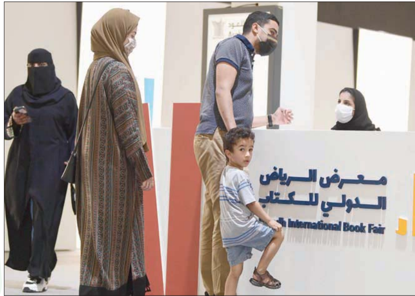
تبارى الناشر من المنصات الإلكترونية للتعريف بمنتجاتهم الفكرية