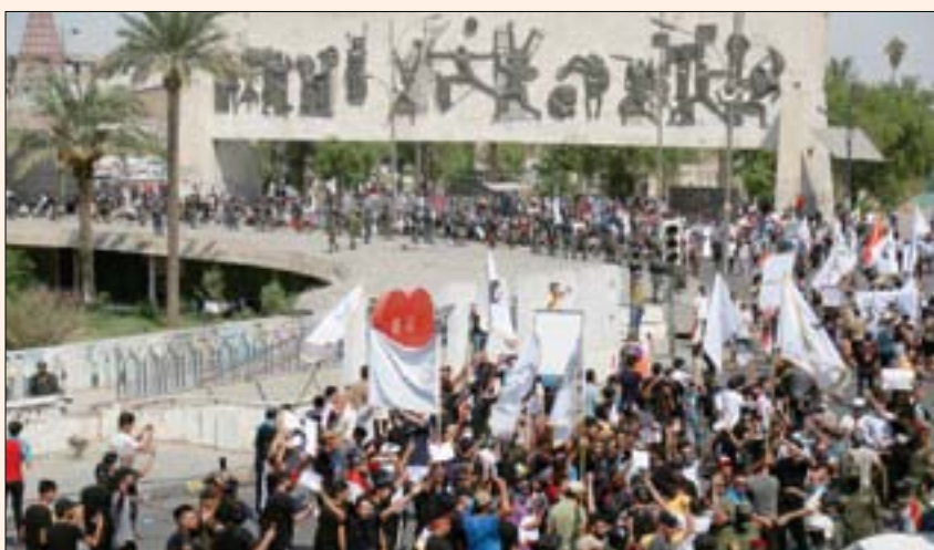
نشطاء يحيون الذكرى الثانية للحراك العراقي في ساحة التحرير ببغداد أمس (أ.ب)

الناصرية، أحد معاقل المئات في مظاهرة مماثلة لإحياء الذكرى وطالبوا بمحاسبة قتلة المظاهرين، وردوا لها مزيج شديد بالاعتصام وتلوح بإمكانية عودتها. من جانبه، طالب محافظ ذي قار أحمد غني الخفاجي، باستكمال التحقيقات في «الأحداث العنيفة»، التي راقت حراك «تشرين»، ودعا الشباب إلى المشاركة بقوة في تعزيز المسار الديمقراطي وصولاً إلى تحقيق الدولة الناجزة.