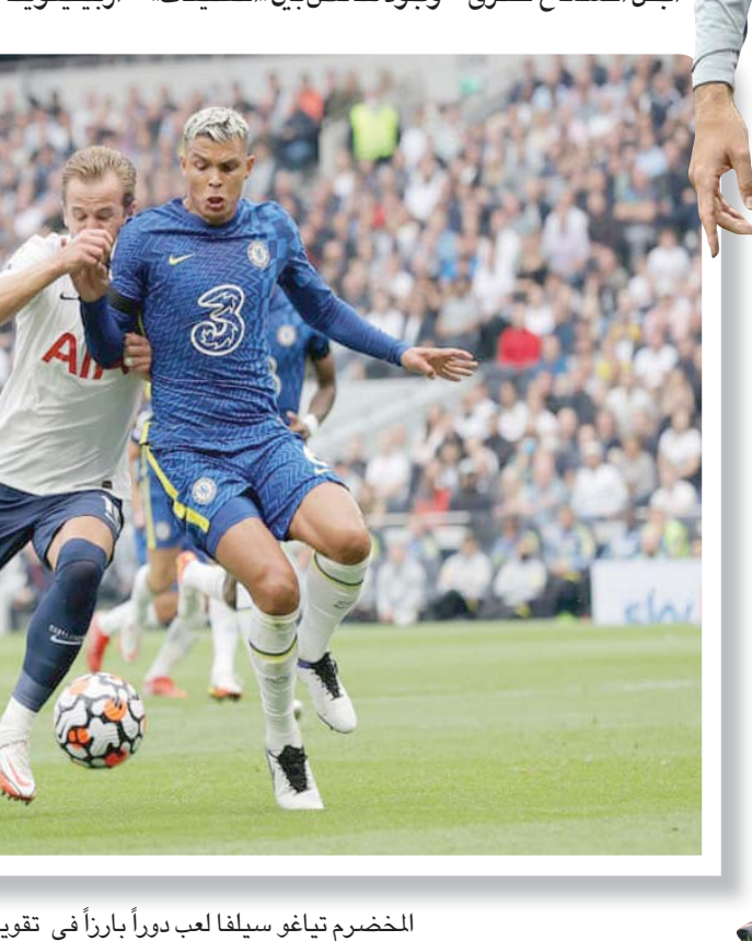
الخضرم تياغو سيلفا لعب دوراً بارزاً في تقوية دفاع تشيلسي

أبدا، وحاول أن تغلق نصف المساحات. ومن حين لآخر، نسمع البعض في فقرات التحليل للمباريات على شاشات التلفزيون، وفي كثير من الأحيان على منابر الحمقى على وسائل التواصل الاجتماعي، يتحدثون عن وجود تناقض بين «التكتيكات