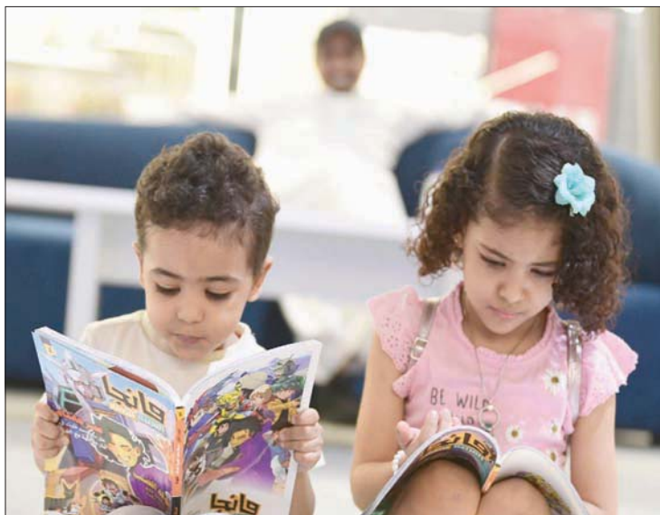
اهتم معرض الرياض بمطبوعات الأطفال