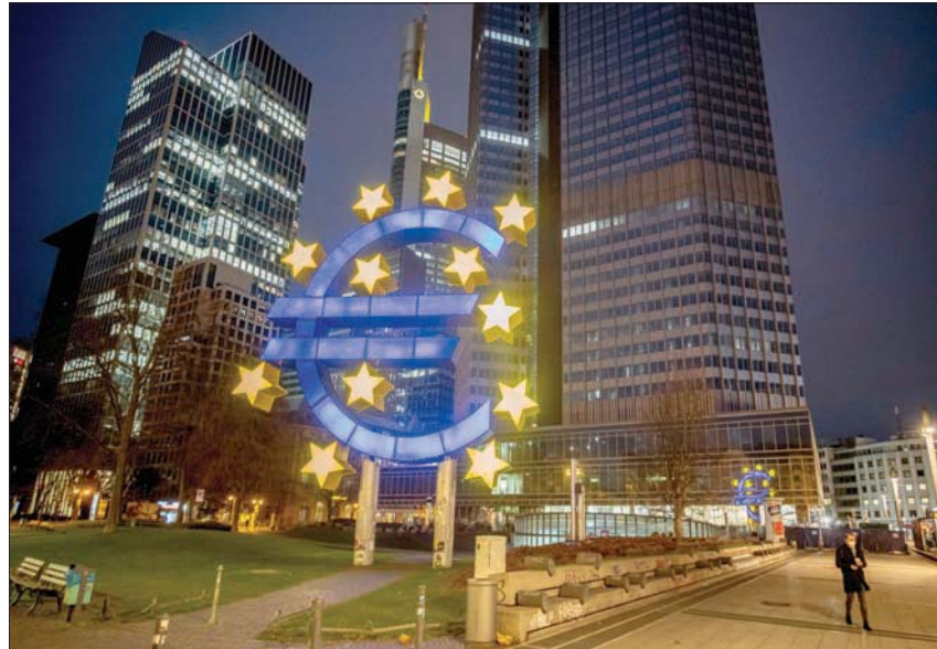
يبحث وزراء الاتحاد الأوروبي ومسؤولو المفوضية والبرلمان الأوروبي سبل السيطرة على الأسعار

وتعاني المصانع جراء مشكلات لوجستية، ونقص في المنتجات وأزمة عمالة ناجمة إلى حد كبير عن الاضطرابات الجارية