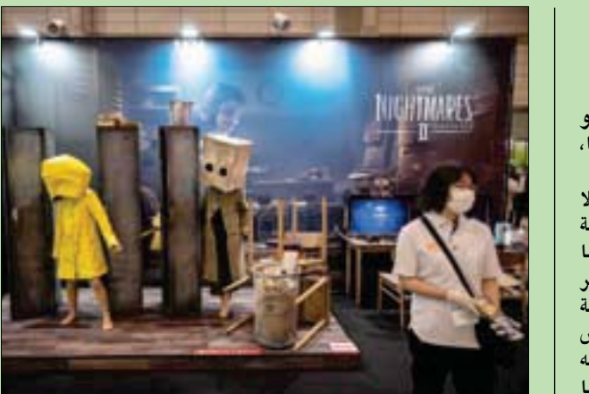
جانب من معرض ألعاب الفيديو في العاصمة اليابانية