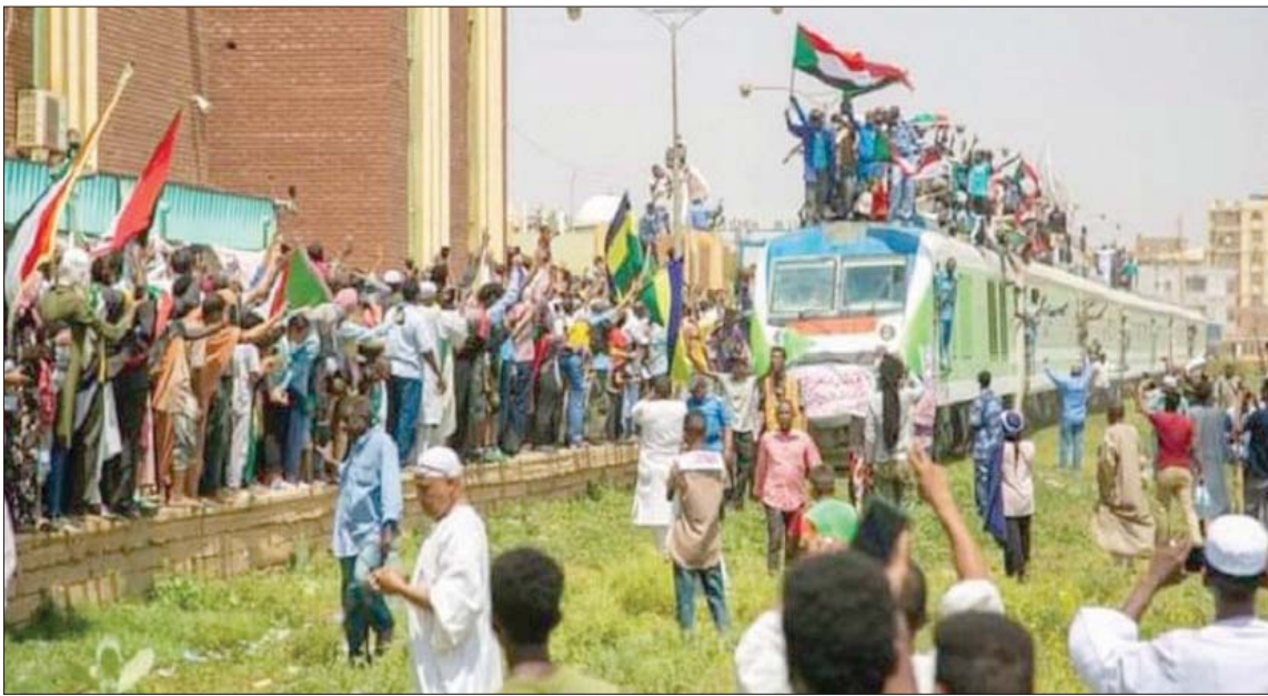
قطار عطبرة لدى وصوله إلى محطة الخرطوم أمس

جرت محاولة لاختطاف وانتحال اسم مجلس السيادة، متسائلًا: «هل كان المجلس على دراية تامة بهذا المسعى السيادي في دعم