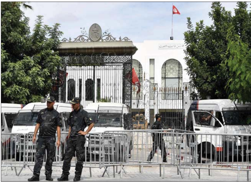
عناصر من الأمن التونسي أمام مقر البرلمان أمس

أشارت في بيان لها إلى أن «تكتليف رئيسة حكومة من دون التقيد بالإجراءات الدستورية وعلى أساس أمر رئاسي لا