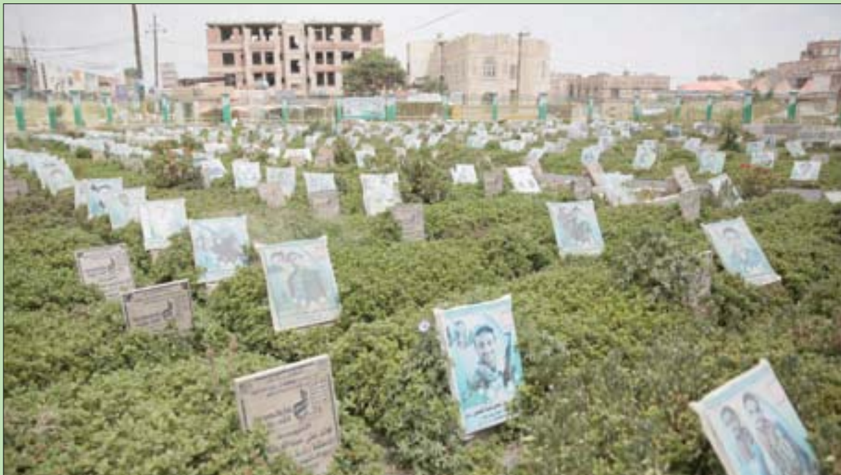
مقبرة في صنعاء توزعت فيها صور عشرات المقاتلين الحوثيين الذين قتلوا في المعارك الأخيرة