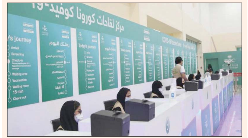
السعودية تحت على التطعيم بجرعتين ضد «كورونا»

ودخول أي مناسبة ثقافية أو علمية أو اجتماعية أو ترفيهية، كذلك دخول أي منشأة حكومية أو خاصة، سواء لأداء الأعمال أو المراجعة، وركوب الطائرات ووسائل النقل العام. وبين المصدر أن إعفاء الفئات المستثناة من أخذ اللقاح سيتم وفق ما يظهر في تطبيق «توكنا». وشددت على ضرورة التزام الجميع بالإجراءات الاحترازية والتدابير الوقائية والبروتوكولات المعمدة وعدم التهاون في ذلك، وأوضح أن جميع الإجراءات والتدابير تخضع للتقييم المستمر من قبل الجهات الصحية المختصة، وذلك بحسب تطورات الوضع الوبائي.