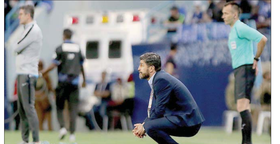
بيدرو إيمانويل مدرب النصر الجديد (الشرق الأوسط)

وقال النصر عبر حسابه على موقع تويتر: «رسمياً البرتغالي بيدرو إيمانويل مديراً للفريق الأول لكرة القدم». ويتوقع أن يبدأ المدير الفني الجديد مهامه منتصف الأسبوع المقبل حيث تنتظره مسؤوليات كبرى على مستوى