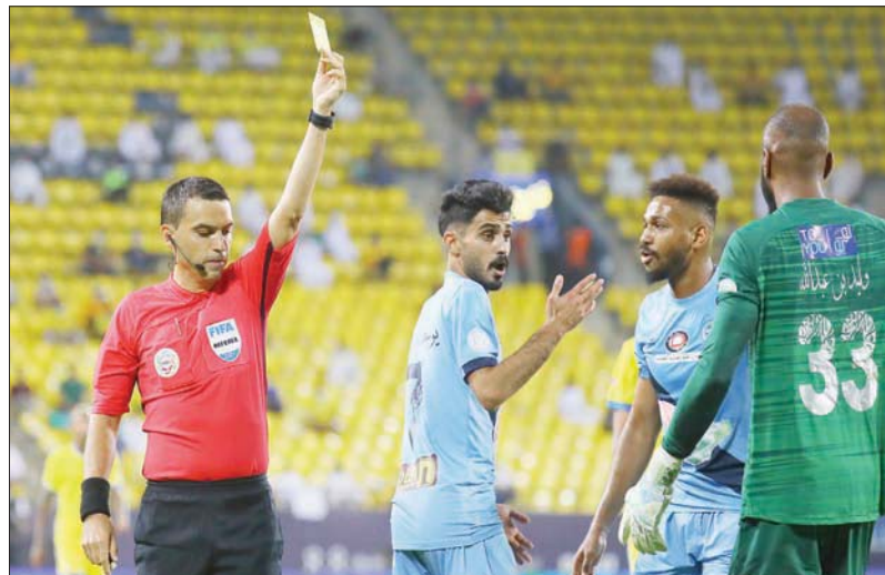
الحكم الروماني هاتيانغ أدار أكثر من 20 مباراة في الدوري السعودي في السنوات الأخيرة مزاحماً الحكم المحلي

ولا يزال الحكام السعوديون يواجهون حرباً ضروساً من قبل مسؤولي الأندية والجماهير فضلاً عن الإعلام الملون الداعم للنادية ويزيد ذلك من خلال عدم قدرة اتحاد الكرة على حماية الحكام خارج الملاعب إذ يتعرضون لأقسى الإساءات والالتزامات دون وقفة جادة من جانبهم فضلاً عن أن لجنة الحكام تعرضت لتغييرات متعددة