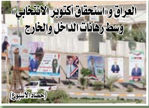
العراق و«استحقاق أكتوبر الانتخابي» وسطرهات الدخول والداخل