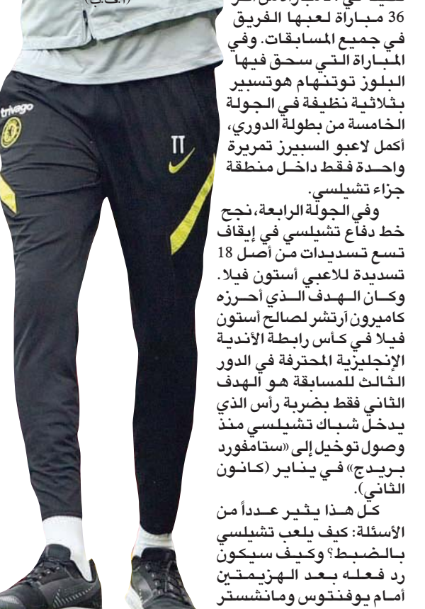
الخضرم تياغو سيلفا لعب دوراً بارزاً في تقوية دفاع تشيلسي

أبدا، وحاول أن تغلق نصف المساحات. ومن حين لآخر، نسمع البعض في فقرات التحليل للمباريات على شاشات التلفزيون، وفي كثير من الأحيان على منابر الحمقى على وسائل التواصل الاجتماعي، يتحدثون عن وجود تناقض بين «التكتيكات