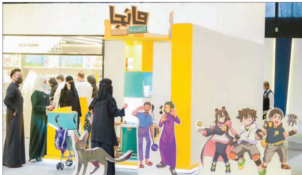
جناح «مانجا العربية» في معرض الرياض