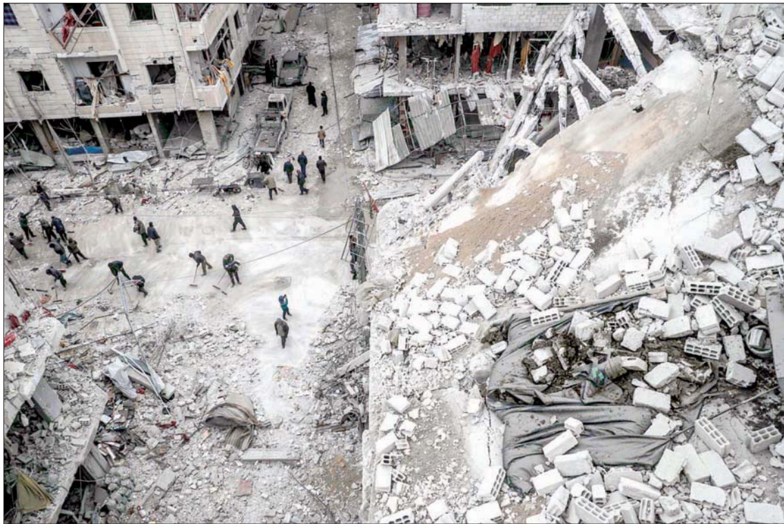
سوريون وسط الدمار في دوما بالغوطة الشرقية لدمشق في 22 فبراير 2018

لهذه المقاربة أمر جوهري، إضافة إلى الاعتراف بالمصالح الشرعية لروسيا، ثم التعاون معها لتحديد نقاط مشتركة على أمل المضي قدماً نحو الحل السياسي وتنفيذ القرار الدولي 2254، وكان هناك رهان على أن يفضي الحوار بين مبعوثي الرئيسين بابين وبوتين في جنيف الذي تضمن إلى الآن جولتين في بداية يوليو (تموز) ومنتهى في 2254 واللجنة الدستورية ودور إيران وعودة اللاجئين والنازحين، و«العرض» المقدم من الأطراف الأخرى فيما يتعلق بالتحكيم والانتخابات السياسية والدبلوماسية، واستثناءات من العقوبات وتمويل بنية تحتية، والتعاون المشترك ضد الإرهاب.