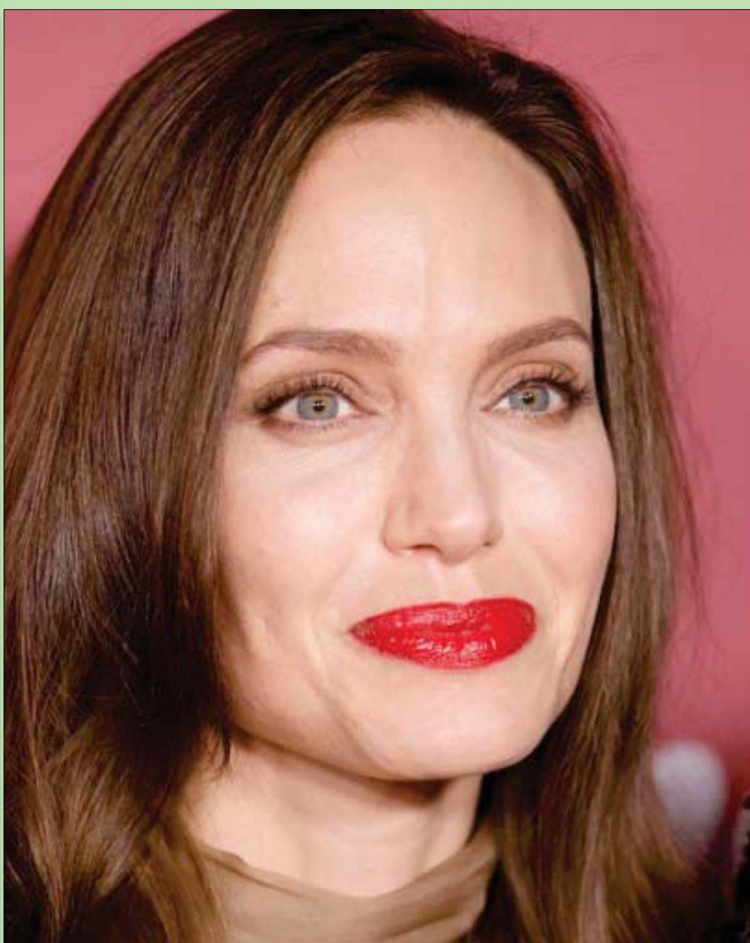
الممثلة الأميركية أنجلينا جولي حضرت حفل «قوة النساء» الذي نظمته مجلة «فاري تي» في بيفرلي هيلز بكاليفورنيا

الواقع أنني أعجبت به قائلاً ببني وبين نفسي: أه منك يا (عكروت) - ومعناها يا (شاطر).