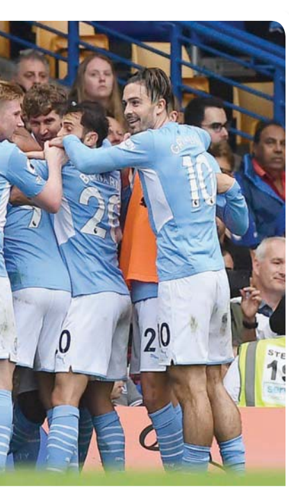
فرحة لاعبي مانشستر سيتي بعد هدف الفوز على تشيلسي

أبدا، وحاول أن تغلق نصف المساحات. ومن حين لآخر، نسمع البعض في فقرات التحليل للمباريات على شاشات التلفزيون، وفي كثير من الأحيان على منابر الحمقى على وسائل التواصل الاجتماعي، يتحدثون عن وجود تناقض بين «التكتيكات