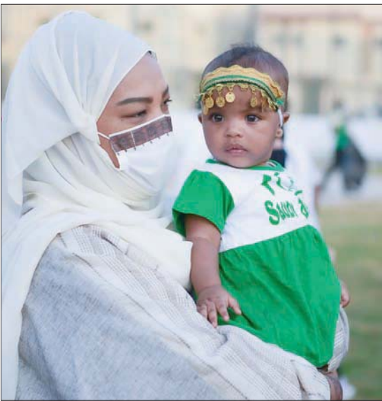
طفلة ترتدي ملابس بلون العلم وتزين بحلي تراثية مع والدتها في احتفالات الدرعية