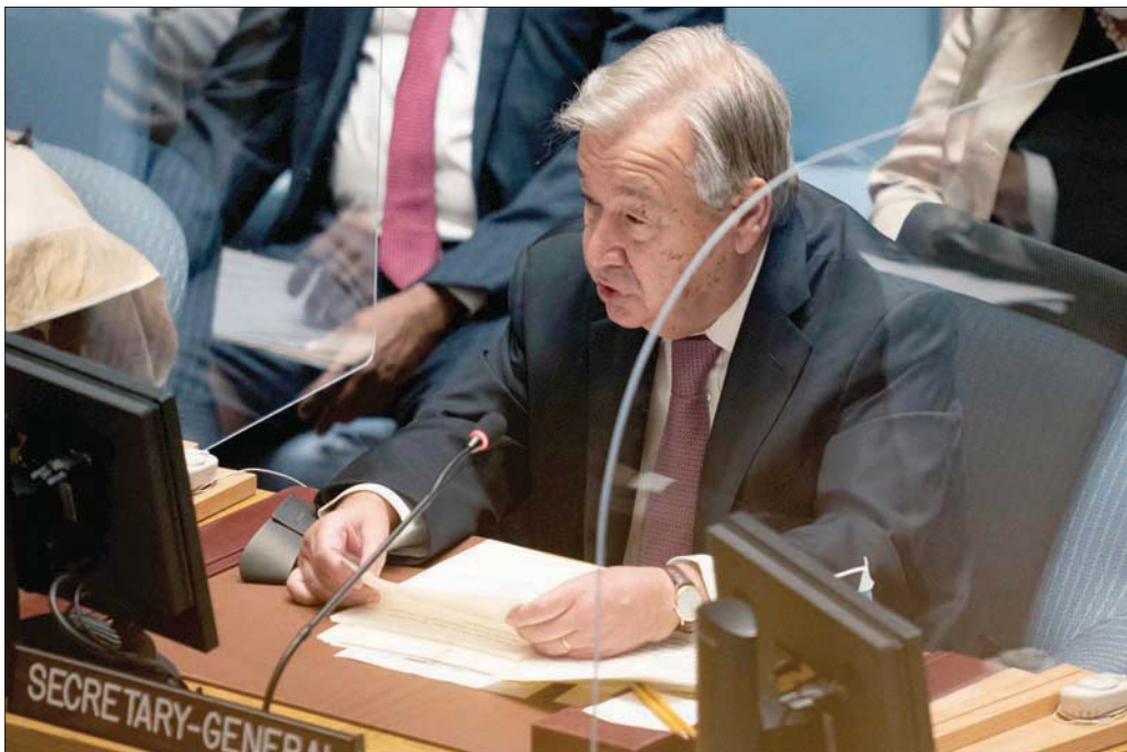
قال غوتيريش إن وزراء خارجية الدول الدائمة العضوية الخمس أكدوا أنهم جميعاً يريدون «أفغانستان تحترم فيها حقوق النساء» (أ.ف.ب)

وتجنب وقوع مجاعة، والتعامل مع النظام الصحي المهلهل في البلاد وسط تفش جديد لفيروس كورونا. وما يزيد الطين بلة، قيام معظم النخبة المتعلمة في البلاد بالفار منها مما يحرم طالبان من إرسال بشري مهم. ورغم استمرار بقاء بعض منظمات المساعدات الدولية في البلاد، المبرك: حيث إن إحدى النقاط التي روحت لها الحركة هي فكرة أن سيطرتها على السلطة في أفغانستان تمثل نهاية الصراع الدائر منذ 40 عاماً وعودة للسلام والسلامة العامة. وقال فيليبس إن تنظيم داعش خراسان أبعد ما يكون عن أهم التحديات التي تواجهها طالبان؛ إن طالبان تواجه مهمة لا تحسد عليها تتمثل في إعادة بناء أفغانستان بعد الحرب التي استمرت طوال أربعة عقود، ومنع حدوث أزمة اقتصادية،