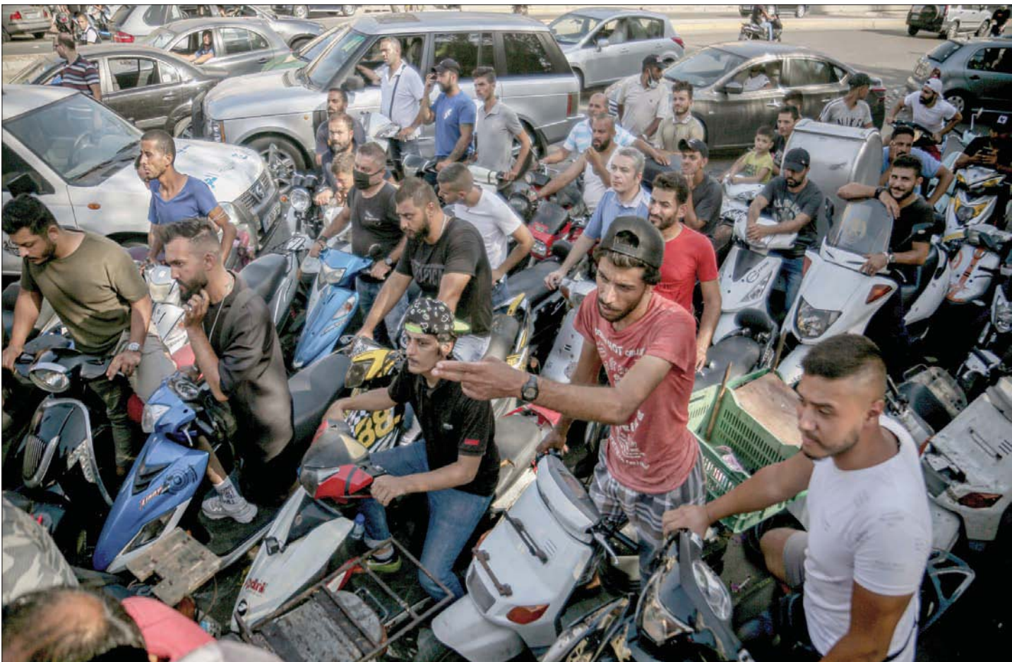
أصحاب سيارات ودراجات نارية ينتظرون أمام إحدى محطات البنزين في بيروت أمس

محددة من قبله؛ بعضها مجاناً والبعض الآخر بمبالغ مالية يسعر أدنى من المحدد رسمياً بنحو 20 في المائة، وذلك عبر شركة «الأمانة» التابعة للحزب. ووفق بيان صادر عن الشركة، فقد حدد سعر صفيحة المازوت الرسمي محدد بنحو 187 الف ليرة، فيما السعر ويجري الإعلان تبعاً عن توزيع مادة المازوت لقطاعات محددة؛ منها الصحية والمولدات التابعة للبلديات... وغيرها، واللائق أنها لا تقتصر فقط على مناطق؛ إنما أيضاً في مناطق خصومه، كما حدث في مناطق بقايعه وأدى إلى انقسام بين أبنائها بين مرحب ورافض للمازوت الإيراني.