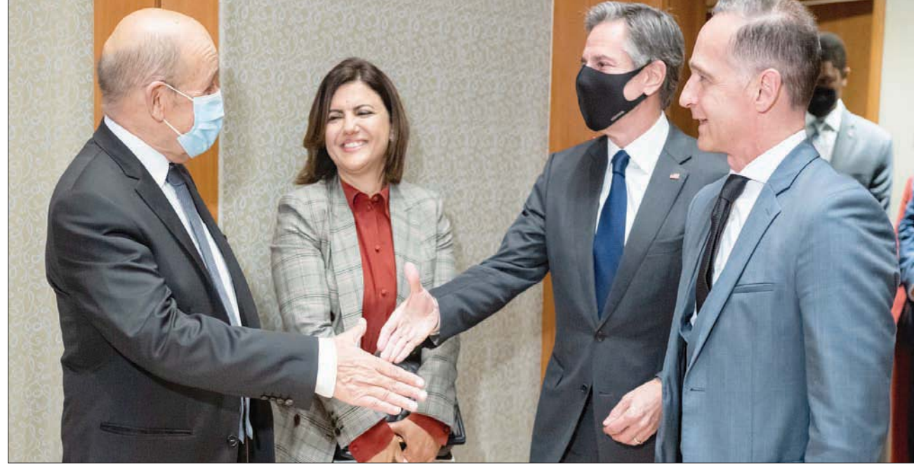
جانبا من لقاء وزراء خارجية أميركا وفرنسا وألمانيا وليبيا على هامش الاجتماع الذي شاركوا فيه مساء أول من أمس في نيويورك حول ليبيا

حقوق الإنسان التابع للأمم المتحدة، بشأن عمل ليبيا لتوثيق انتهاكات حقوق الإنسان، فضلا عن الحاجة الإنساني الدولي. وأضاف: «على وصول البعثة دون عوائق. بدوره، اعتبر السفير الأميركي لدى ليبيا، ريتشارد نورلاند، أن مشاركة بلينكن في الاجتماع كانت دليلا آخر، رفيع المستوى، على دعم الولايات المتحدة للبيبي، خاصة أنها تستعد الآن بجديداً لانتخابات 24 ديسمبر (كانون الأول) المقبل، التي اعتبر أنه «لا عودة للوراء» عنها.