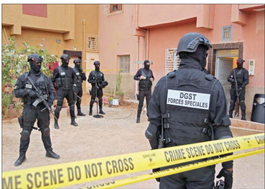
استنفاً أمّني في مدينة الرشيدية المغربية عقب ضبط عناصر من خلية إرهابية مرتبطة بـ«داعش»

بـ«ولاية خراسان»، باعتبارها ملاماً جديداً للتنظيمات الإرهابية في أفغانستان، كما عبّروا عن مناصرتهم ومباركتهم للعمليات التي استهدفت مطار العاصمة الأفغانية في الأونة الأخيرة. وأشار البيان إلى أنه يتواصل حالياً إيداع جميع الموقوفين في إطار هذه الخلية الإرهابية، البالغ عددهم إلى حد الآن سبعة أشخاص، تحت تدبير الحراسة النظرية (الاعتقال الاحتياطي) رهن إشارة البحث القضائي الذي يجريه المكتب المركزي للأبحاث القضائية تحت إشراف النيابة العامة المكلفة بقضايا الإرهاب والتطرف.