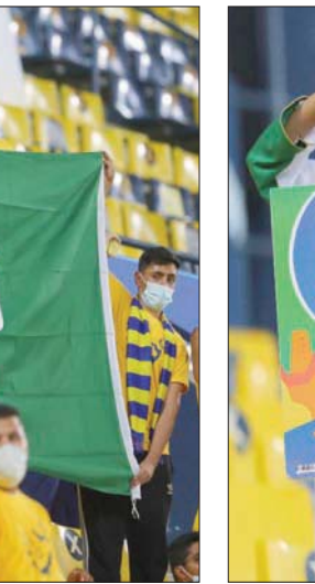
مشجعان يحتفلان باليوم الوطني

كما تعاون الاتحاد السعودي للرياضة مع الاتحاد السعودي للرياضة ومؤسسة «مسك الخيرية»، لإطلاق مسيرة الدراجات تمتد لمسافة 15 كلم في تاريخ 23 سبتمبر احتفالاً باليوم الوطني السعودي الـ91 في كل من الرياض والخبر جيدة.