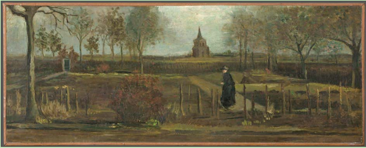
لوحة فان «حديقة القسيس في نيونين» كانت جزءاً من معرض مؤقت ينظمه متحف «سينجر لارين» (متحف «غروينغر»)

وكانت جزءاً من معرض مؤقت ينظمه متحف «سينجر لارين»، على سبيل الاستعارة من متحف «غروينغر» في غروينغن. وأظهرت لقطات كاميرات الأمن المرتبطة بعملية السطو التي وقعت العام الماضي، رجلاً يستخدم مطرقة لثقيلة لتحميم بابين زجاجيين لاقتحام المتحف، وبعد ذلك غادر مع اللوحة تحت ذراعه.