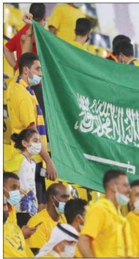
نصراويون يرفعون علم المملكة في مدرجات ملعب مرسلو بارك

وأعلن الاتحاد السعودي للرياضة البحرية والغوص عن تخصيص ثلاث جوائز لكل فئة بالمسابقة، حيث سيحصل صاحب المركز الأول على جائزة قيمة، وسيحصل المركز الثاني على جائزة قيمة، وسيحصل المركز الثالث على جائزة قيمة. وستقام هذه المسابقة في مدينة الرياض، حيث ستقام تحت خاص باليوم الوطني في مضمار المشي الخاص بالاتحاد في النخيل مول عبر تطبيق المشركين في التحدي، قطع 2030 خطوة للفوز بجوائز مميزة.