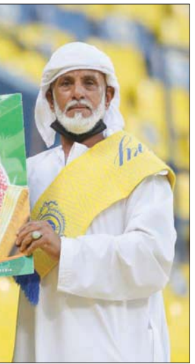
مشجعان يحتفلان باليوم الوطني

وختم الأمير فهد بن جلوي حديثه: القطاع الرياضي وفي ظل الدعم اللا محدود من القيادة الرشيدة ومتابعة الأمير عبد العزيز بن تركي الفيصل وزير الرياضة ورئيس اللجنة الأولمبية السعودية يعيش أوج عطاءاته من استضافات وإجازات رياضية. وقدم الأمير فيصل بن بندر بن سلطان رئيس الاتحاد السعودي للرياضات الإلكترونية التهناني والتبريكات للقيادة وللمقام خادم الحرمين الشريفين والأمير محمد بن سلمان ولي العهد بمناسبة حلول اليوم الوطني الـ91 وإلى كل مواطن ومقيم، مضيفاً: ندعو الله أن يظل علم بلادنا مرفرفاً في السماء عالياً مواصلاً للمجد والأزدهار.