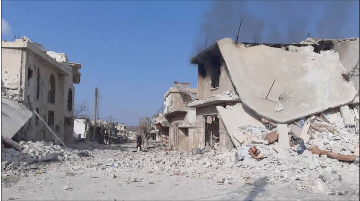
آثار الدمار بعد قصف مدفعي سوري على جنوب إدلب

تمثلت في الرد المباشر من قبل فصائل المعارضة على مصادر إطلاق النار التابعة لقوات النظام بمختلف أنواع الأسلحة الثقيلة، بدءاً على طول خطوط المواجهة، بدءاً من جبل الأكراد مروراً بجبل الزاوية وريف إدلب الجنوبي وصولاً إلى ريف حلب، حيث تم قصف كل من معسكرات جورين ومبرزو والقصف المدفعي والصاروخي من معسكرات سراقب وكفرنبيل الإيرانية، الذي يطال كل القرى والبلدات الواقعة بجبل الزاوية وجنوب إدلب، وتزامن ذلك مع استخدام تعزيزات عسكرية لقوات النظام ومعدات عسكرية والبيات إلى معسكر جورين غربي حماة، ومعسكرات سراقب وكفرنبيل ومعرة النعمان خلال الأيام الأخيرة الماضية.