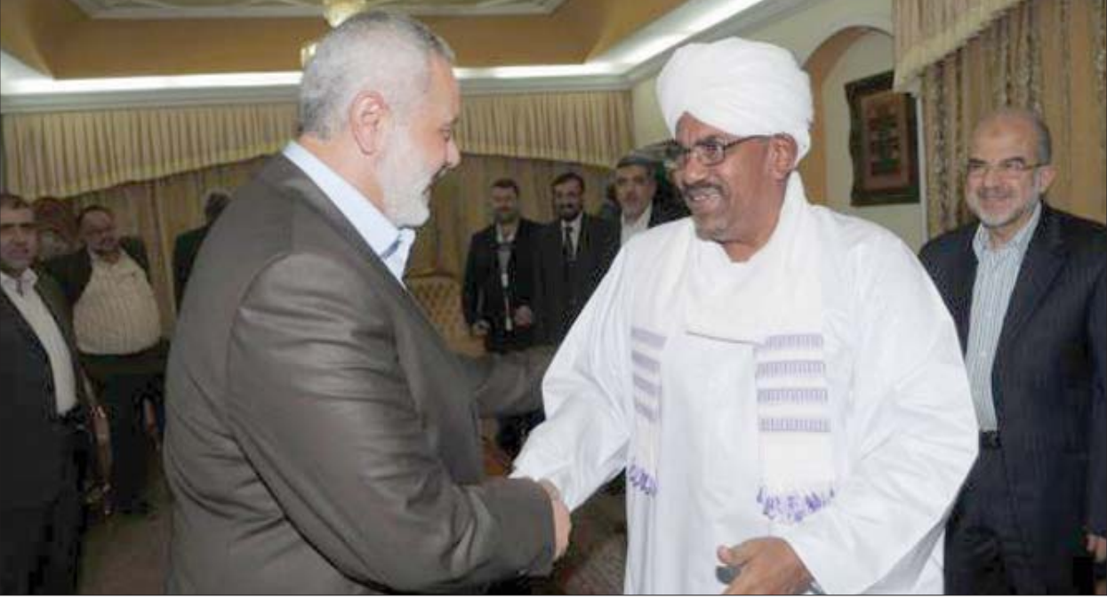
لقاء رئيس المكتب السياسي لحركة «حماس» إسماعيل هنية والرئيس السوداني السابق عمر البشير

ويقول مسؤولون من مجموعة عمل شكلت لتفكيك نظام البشير، إن هذه الثروات تشمل عقارات وأسهما في شركات، وفندقاً في موقع ممتاز في الخرطوم وشركة صرافة ومحطة