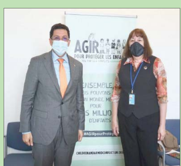
بن مبارك خلال لقائه جامبا

وفي حين أشار إلى أن مواطني بلاده يحتاجون للمساعدات الطارئة نتيجة النزوح والفقر وانعدام الأمن الغذائي، أوضح أن أكبر العوامل التي تدفع نحو خطر المجاعة هو الانخفاض الهائل في القدرة الشرائية؛ حيث يعاني الاقتصاد اليمني من أزمة حادة، وانخفض الناتج المحلي الإجمالي بنسبة تفوق 50 في المائة منذ العام 2015.