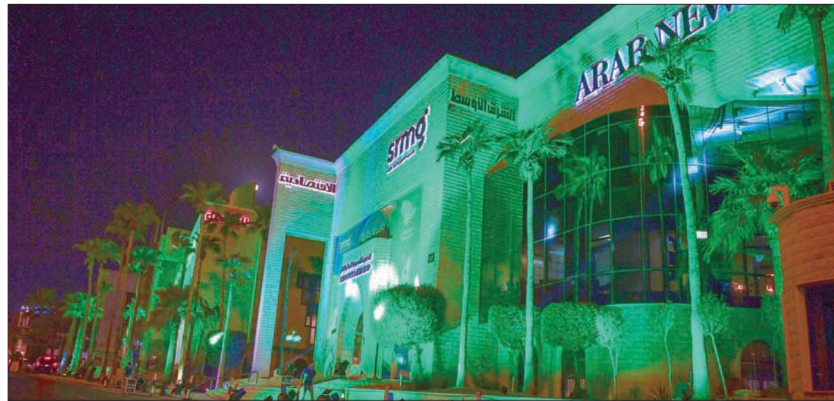
مقر المجموعة السعودية للأبحاث والإعلام كان بين الأبنية التي اكتست باللون الأخضر احتفاءً باليوم الوطني