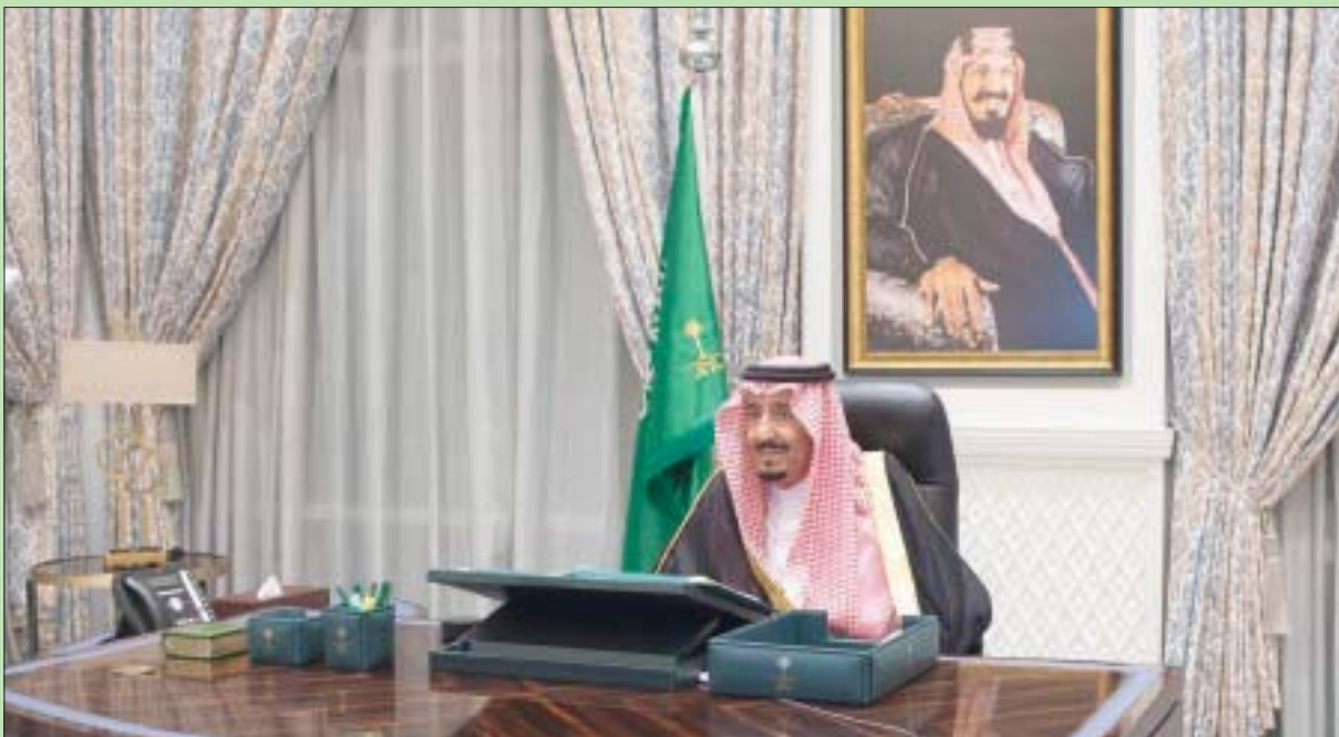
خادم الحرمين الشريفين الملك سلمان بن عبد العزيز

كما تلقى برقيات تهنئة من عدد من المسؤولين والسياسيين اللبنانيين، بينهم الرئيس ميشال عون، ومفتي الجمهورية الشيخ عبد اللطيف دريان، ورئيس الحكومة السابق سعد الحريري، ووزير الداخلية والبلديات القاضي بسام مولوي، ورئيس الحكومة السابق فؤاد السنورة، والنائب المستقل مروان حمادة. وشملت برقيات التهاني العاهل المغربي الملك محمد السادس، ورئيس الوزراء الباكستاني.