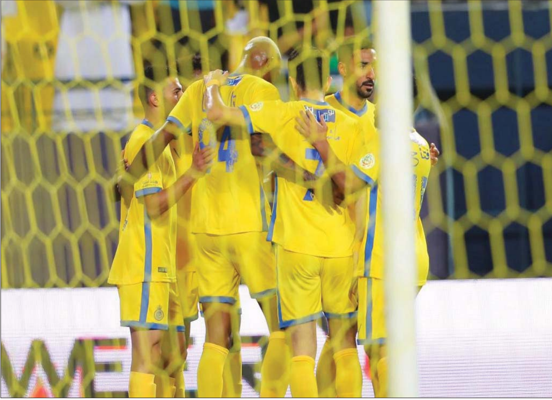
فرحة نصرارية بعد هدف الفوز على الباطن