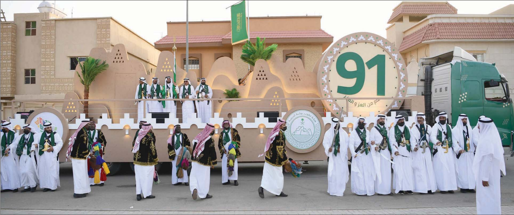
جانب من احتفالات الدرعية أمس