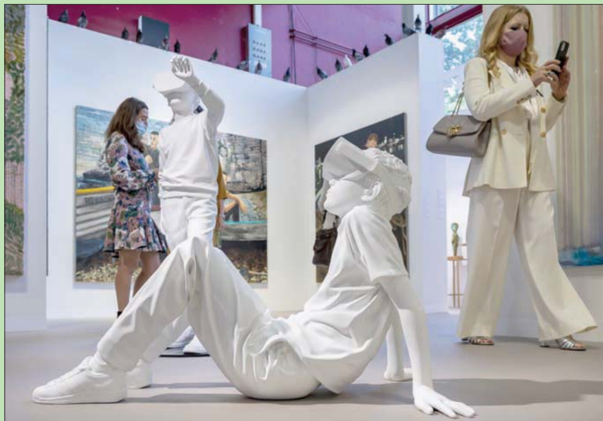
أعمال فنية في معرض بازل بسويسرا