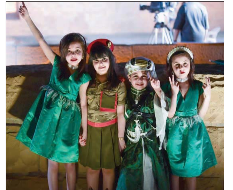
أطفال يشاركون في الاحتفالات

بمشاركة 1000 دار نشر بينها 13 عراقية و46 سورية