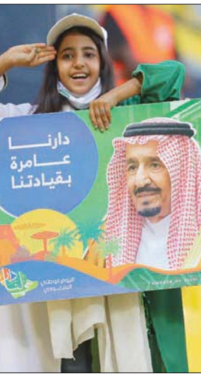
مشجعان يحتفلان باليوم الوطني

فيما أطلق الاتحاد السعودي للرياضة البحرية والغوص بطولة الملكة للديابات البحرية في ينبع والتي تستمر حتى مساء يوم السبت وذلك بمناسبة ذكرى اليوم الوطني الـ91.