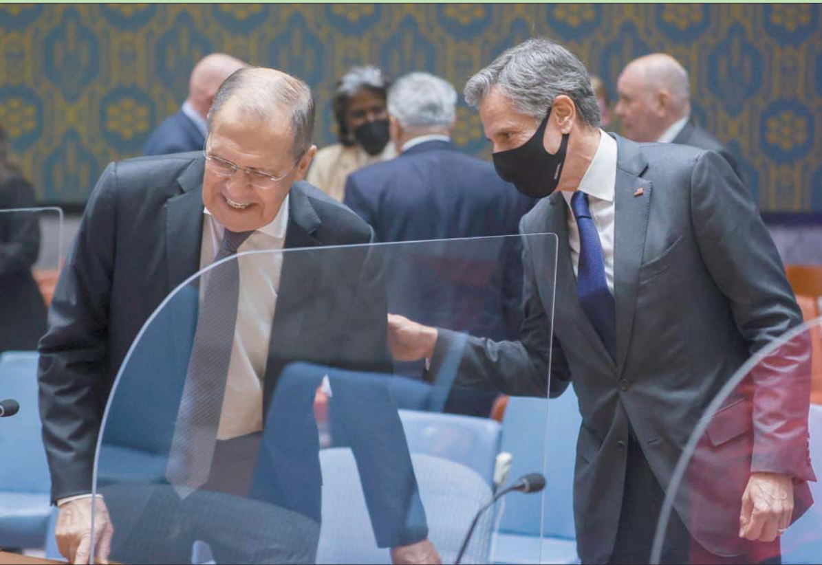
وزير الخارجية الأميركي والروسي خلال اجتماع وزراء خارجية الدول دائمة العضوية في مجلس الأمن بنيويورك مساء الأربعاء