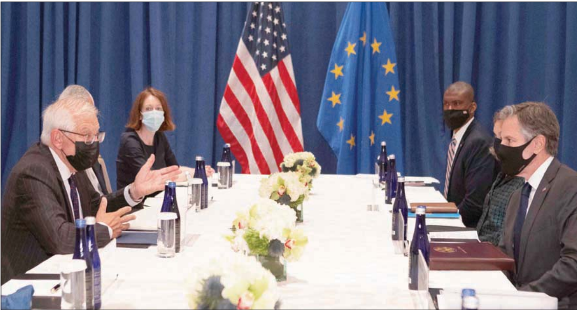
بيلينكن يلتقي بوريل على هامش الجمعية العامة للأمم المتحدة أول من أمس

أكد مسؤول السياسة الخارجية في الاتحاد الأوروبي، جوزيب بوريل، إثر محادثات مع وزير الخارجية الأمريكي أنطوني بلينكن، أن «وقت العودة» إلى الاتفاق النووي «ليس إلى أجل غير مسمى»، في ظل انبعاث عن اقتراب موعد عقد جولة سابعة من محادثات فيينا للأطراف المعنية بهذه الخطة.