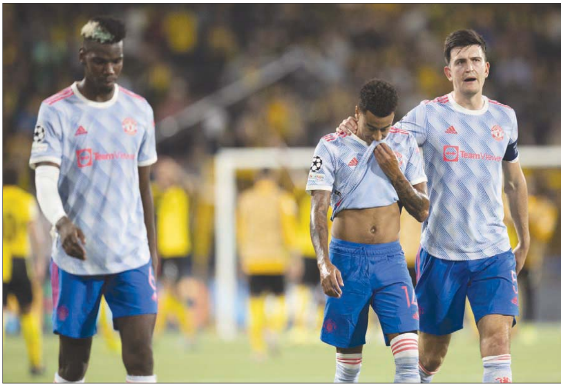
لاعبو يونايتد بعد الهزيمة أمام يانغ بويوز

وينطبق نفس الأمر أيضاً على نادي كلوب بروج البلجيكي، الذي قدم مستويات جيدة للغاية أمام باريس سان جيرمان، الذي دخل تلك المباراة بخط هجوم المرعب المكون من ليونيل ميسي ونيمار وكيليان مبابي. وانتهت تلك المباراة بالتعادل بهدف لكل فريق، وهي النتيجة التي جاءت في الوقت المناسب تماماً لكي نتذكرنا جميعاً بأن كرة القدم هي لعبة جماعية في الأساس. لقد صور الكثيرون في