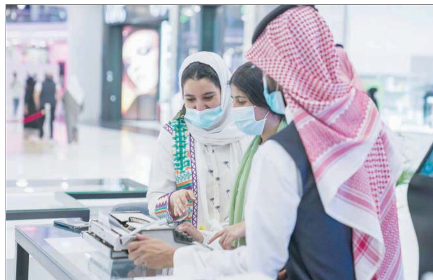
جانب من معرض الرياض الدولي للكتاب في دورة سابقة

الرحمن محمد، ثم أمسية موسيقية للموسيقيار المصري عمر خيرت، وأمسية تجمع الموسيقي العراقي نصير شمة بموطنه المطرب القدير سعدون جابر، فيما ستتناول الأمسية الرابعة الأغاني الشهيرة التي كتبها الشاعر الراحل الأمير عبد الله الفيصل لأم كلثوم وعبد الحليم حافظ وغيرهما من نجوم الأغنية العربية، وإلى جانب ذلك، يحتضن مسرح جامعة الأميرة نورة عرضاً موسيقياً بعنوان «عالم هانز زيمر»، ومسرحية للأطفال بعنوان «أميرات ديزني» التي ستقام على مسرح مركز الملك فهد الثقافي. وناتسي السدرة الجديدة من معرض الرياض الدولي للكتاب تحت شعار «واجهة جديدة»، وفصل جديد، وتحضر فيها جمهورية الطبخ يقدمها طهاة مشهورون. ويحتفي البرنامج الثقافي للمعرض بالفنانين الإبداعية في «جادة الثقافة» التي ستحتضن فعاليات ثقافية متنوعة في 16 منصة على امتداد «واجهة الرياض»، كما يقدم المعرض في مسرح جامعة الأميرة نورة بنت عبد الرحمن أربع أمسيات غنائية وموسيقية ذات قيمة فنية رفيعة، تبدأ بأمسية غنائية للفنان عبد