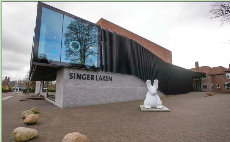
متحف «سينجر لارين»

من جهته، ورداً على الاتهامات المنسوبة إليه داخل المحكمة في وقت سابق من هذا الشهر، قال نيلز إم، الذي يعمل في مراب يتولى داخله إصلاح السيارات، إنه استخدم أحياناً نوع الحزام الموجود في ليردام