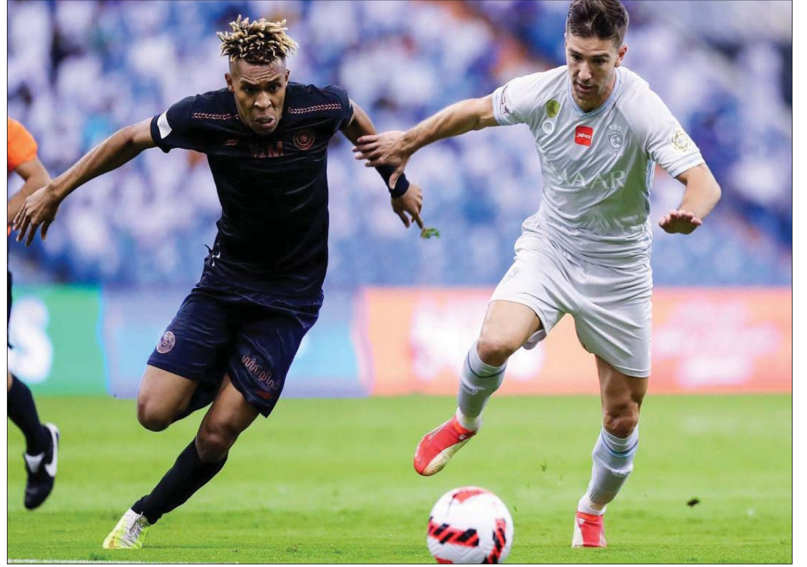
صراع على الكرة بين فيتو والصقور في مباراة الشباب والهلال

بعد الخسارة القاسية والكبيرة من أمام الغريم التقليدي الرائد، في الجولة الماضية، وخسرها بنتيجة 5-3 إلا أن التعاون يدرك تقام على أرض الاتحاد وبين جماهيره.