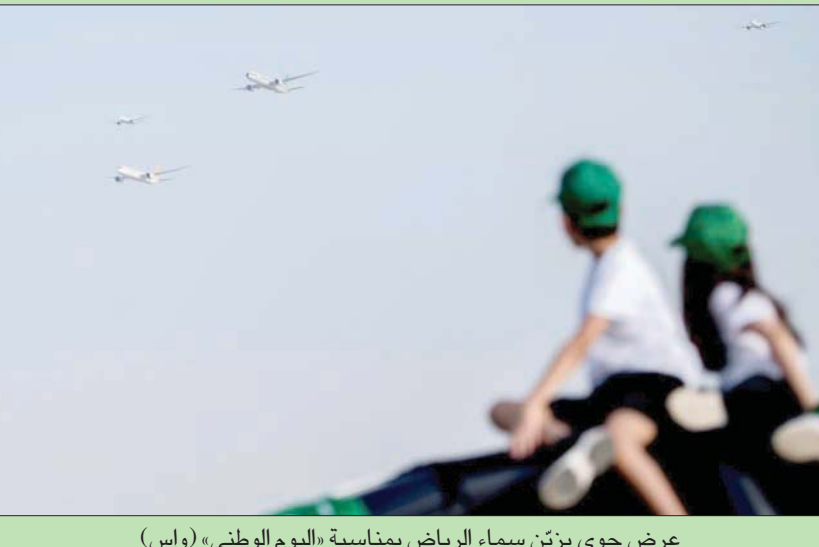
عرض جوي يزين سماء الرياض بمناسبة «اليوم الوطني»

الرياض - واشنطن - لندن، «التشرق الأوسط» أكد خادم الحرمين الشريفين الملك سلمان بن عبد العزيز أن السعودية تسعى لحاضرتها ومستقبلها مستلهمين من تضحيات الأجداد. وقال الملك سلمان في تغريدة عبر حسابه الرسمي على موقع «تويتر» أمس: «في ذكرى يومنا الوطني، نحمد الله دائماً على ما أنعم به علينا في هذه البلاد، من أمن واستقرار ورخاء وتنمية، وسنسعى لحاضرتنا ومستقبلنا، مستلهمين من تضحيات الأجداد والأجداد، من أجل رفعة الوطن وشعبه». وشهدت السعودية أمس احتفالات واسعة في مختلف مناطق ومحافظات البلاد بالتزامن مع اليوم الوطني الـ91. وتلقى خادم الحرمين الملك سلمان ولي عهد الأمير محمد بن سلمان برقيات التهنية من زعماء خليجيين وعرب وغربيين. وشددت الولايات المتحدة على الشراكة القائمة مع السعودية والممتدة على مدى 8 عقود من التعاون والصداقة المتبادلة. وأكد وزير الخارجية الأميركي أنتوني بلينكن، في تهنيته للمملكة، باليوم الوطني، أن قوة تلك الروابط عززت أمن المنطقة، مشيراً إلى أن بلاده بصدد توسيع نطاق التعاون بما في ذلك مواجهة التحدي المتمثل في أزمة المناخ، وكماحة وباء كورونا وتعزيز الانتعاش الاقتصادي العالمي. (تفاصيل ص 2 ويوميات التشرق)