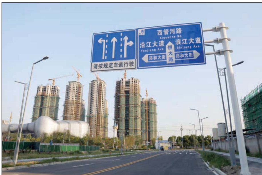
تعهد رئيس «إيفرغراند» ببذل كل الجهود للوفاء بالتزامات المجموعة (رويترز)

وبسبب اضطرابات في الأسواق العالمية. وذكرت صحيفة «تشاينا سيكورييتيز جورنال» المختصة أن رئيس مجلس إدارة المجموعة، شو شيايبن، حث أكثر من 4 آلاف مدير تنفيذي للشركة، مساء الأربعاء، على «تركيز كل طاقتهم لاستئناف العمل والإنتاج وتسليم العقارات». وكانت المجموعة من بين أكبر فترات الصين. وشدد شو أيضاً على أنه يجب «بذل كل ما في الإمكان