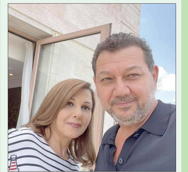
ماجدة الرومي وشقيقها عوض الرومي في اليوم التالي من الحادثة

بيروت، «الشرق الأوسط» وانتشل الفنانة ماجدة الرومي بخير حالة الإغماء التي تعرضت لها أثناء غنائها في حفل ضمن مهرجان جرش. وتم تداول اللقطة المصورة التي تظهرها وهي تنهأ على المسرح، وبحسب شقيقها ومدير أعمالها عوض الرومي، فقد أكد بان الفنانة اللبنانية تعرضت إلى انخفاض ضغطها بسبب إرهاق شديد أصابها أثناء التحضيرات للحفل. وحرصت الرومي التي فقدت توازنها بعد أدائها إحدى أغانيها على عدم توقف الحفل. فقللت من شقيقها أن تستمر الفرقة الموسيقية المرافقة لها في العزف إلى حين عودتها إلى المسرح من جديد. وبالغف، اعطلت ماجدة الرومي بعد دقائق قليلة الخشبة وأكملت الغناء حتى نهاية السهرة.