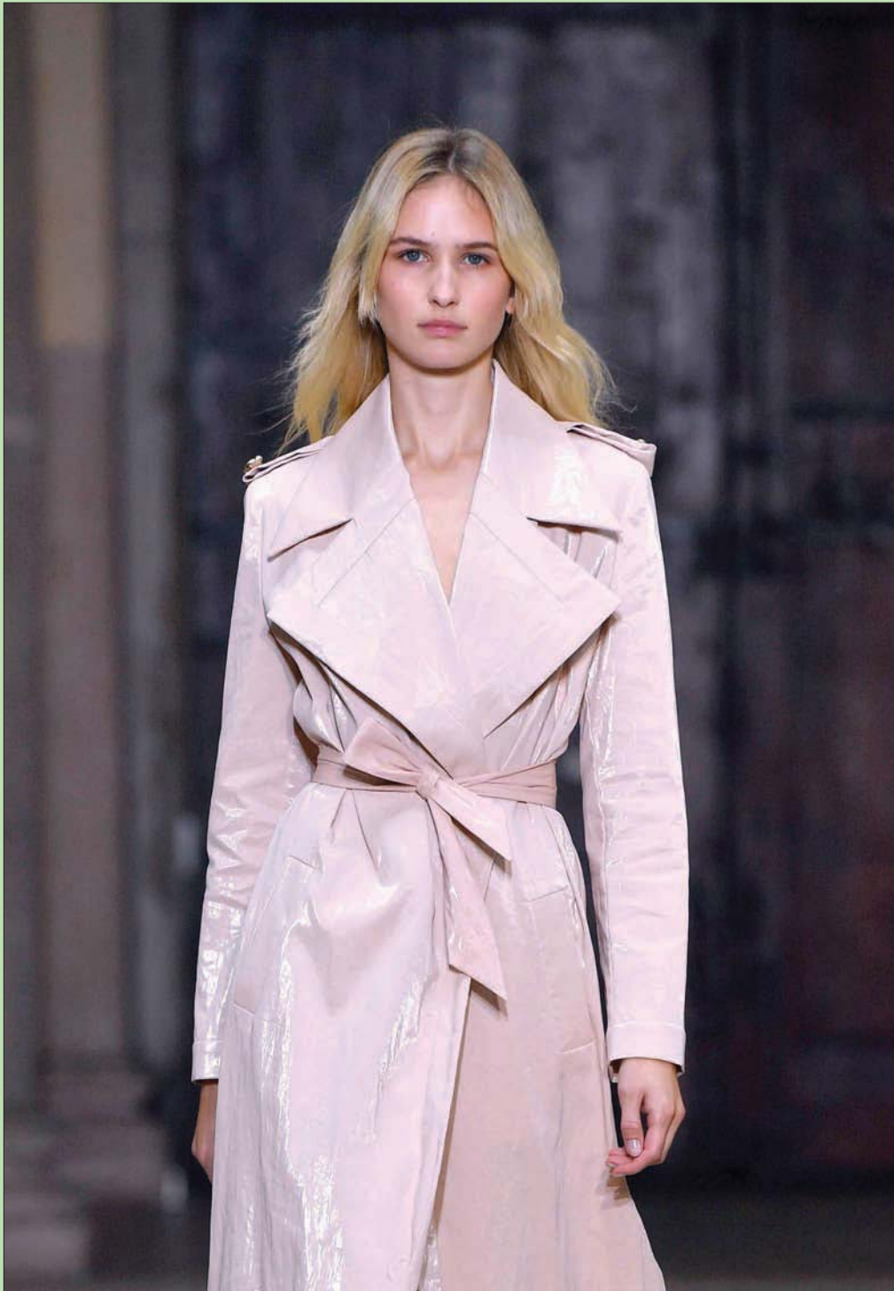
عارضة تقدم زياً لجموعة «جينيز» السنائية لربيع وصيف 2022 خلال أسبوع الموضة في ميلانو أمس

التنوع السعودي البهي، هو سر من أسرار قوتها في الماضي، وفي الحاضر هو من أهم مزايا السعودية التي رسمت مسارها المستقبلي المنفتح على كل العالم، ناسج الحلم، ولي العهد الأمير محمد بن سلمان.