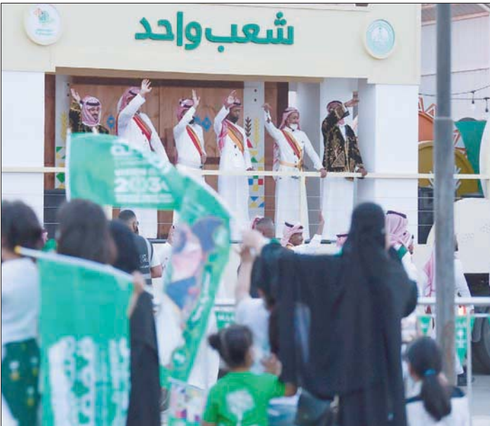
العربات المتنقلة تجوّلت في حدائق الدرعية محملة بعروض فنية مختلفة منها «العرضة النجدية»