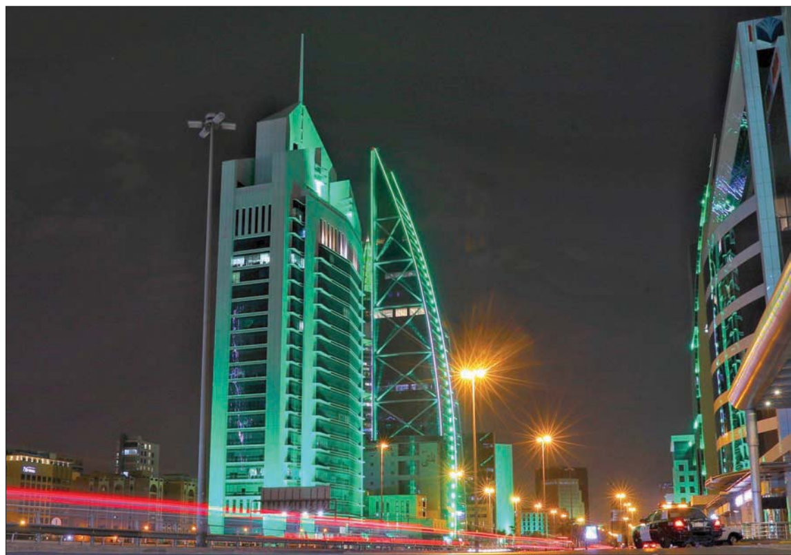
الأبراج والمباني تحفّي بمناسبة اليوم الوطني السعودي

الظروف التي فرضها تفشي فيروس كورونا في العالم. ويواصل برنامج صندوق الاستثمارات العامة وفق جعفر، طموحاته بخطة ثابتة نحو مضاعفة أصول الصندوق تحت «رؤية المملكة 2030»، مشيرين إلى نجاح الخطط في تكريس دور القطاع الخاص كمحور رئيسي في مشروع التنمية الاقتصادية في البلاد.