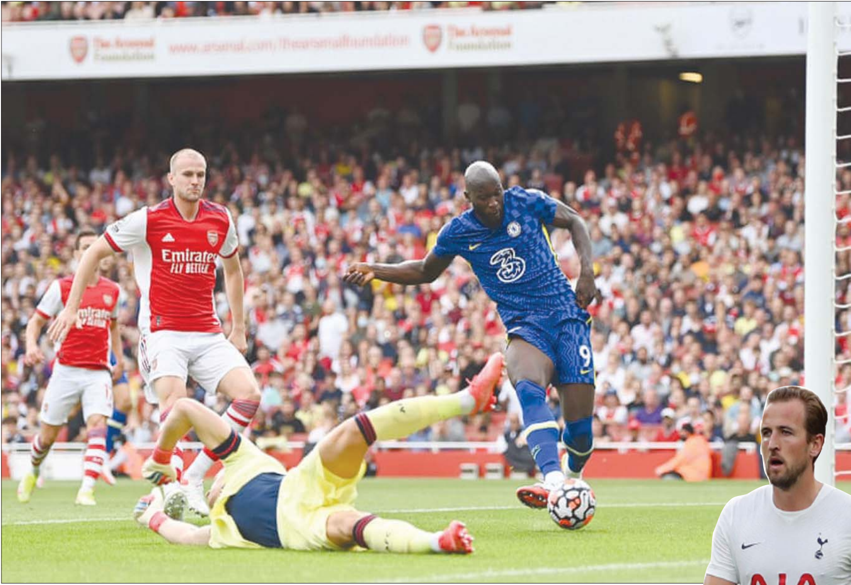
لوكاكو يهز شبك آرسنال بعد أن تلاعب بدفاع المدفعية

لكن في الحقيقة لا يعتقد أن تشيلسي قد أجبر على تلك الخطوة، حيث كان النادي حراً في التعاقد مع المهاجم البلجيكي، الذي لا يقل باي حال من الأحوال عن هاري كين، والذي لا يزال يسير في مسار تصاعدي، كما أنه سبق وأن لعب بقميص البلوز، وبالتالي كان من الأسهل له العودة إلى ناديه القديم. والآن أصبح لدينا لوكاكو الذي انتقل إلى تشيلسي بمقابل مادي هائل، في مقابل هاري كين الذي ظل في توتنهام بسبب مطالب النادي بالحصول على مبالغ مالية طائلة من أجل التخلي عن خدماته. والآن، بات هناك منافس شرس لهاري كين في إطار سعيه السنوي للفوز بلقب هدف الدوري الإنجليزي الممتاز، ويتمثل هذا المنافس هذه المرة في قلب هجوم في فريق قوي يضم كوكبة من النجوم الذين يصنعون له العديد من الفرص، وبالتالي ستكون لديه فرصة كبيرة لإحراز المزيد من الأهداف وعلاوة على ذلك، انتقل لوكاكو إلى حامل لقب دوري أبطال أوروبا وهو يدرك جيداً أنه