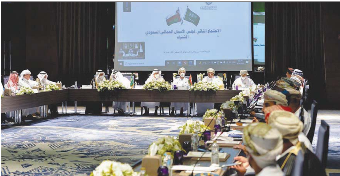
الاجتماع الثاني لمجلس الأعمال السعودي - العماني الذي اختتم أمس في مسقط

مسقط، مبرزا الخويلدي اختتمت في العاصمة العمانية مسقط، أمس، فعاليات المنتدى الاستثماري العماني - السعودي، واجتماعات مجلس الأعمال السعودي - العماني المشترك، للتعريف بالفرص الاستثمارية بين البلدين، وتعزيز الاستثمارات في مختلف المجالات. وشهد يوم أمس توقيع مذكرة تفاهم في مجال تعزيز وتشجيع الاستثمار المشترك بين المملكة العمانية وسلطنة عمان، وشهد المنتدى الاستثماري العماني - السعودي توقيع سلطنة عمان والسعودية مذكرة تفاهم في مجال تعزيز وتشجيع الاستثمار المشترك، كما تم توقيع مذكرة تفاهم للبحث فرص التعاون بين شركة تنمية أسماك عمان المملوكة لجهات الاستثمار العماني والمجموعة الوطنية للاستزراع المائي (نقود) السعودية في مشروع استزراع الروبيان في ولاية الجازر بمحافظة الوسطى. ووقع أيضاً عدد من رجال الأعمال السعوديين اتفاقيات ومذكرات تفاهم مع عدد من الشركات العمانية تتعلق بالاستفادة من الخدمات، ويحث الفرص الاستثمارية المستقلة بين البلدين. ويبحث قيس بن محمد البوسف، وزير التجارة والصناعة وترويج الاستثمار العماني، مع خالد بن عبد العزيز الفالح، وزير الاستثمار السعودي، أفاق التعاون التجاري والاستثماري والفرص الاستثمارية الواعدة. الرغبة الجادة وقال قيس البوسف: «استشرنا في هذه الزيارة رغبة جادة في بناء شراكة متنامية في القطاعات الاقتصادية الاستراتيجية التي تهتم بالبلدين... إننا على أتم الاستعداد لدفع هذه الشراكة، وتحقيق مجالات التكامل فيها». وأضاف وزير التجارة والصناعة العماني: «إن القوات التنافسية الجاذبة، والبيئة