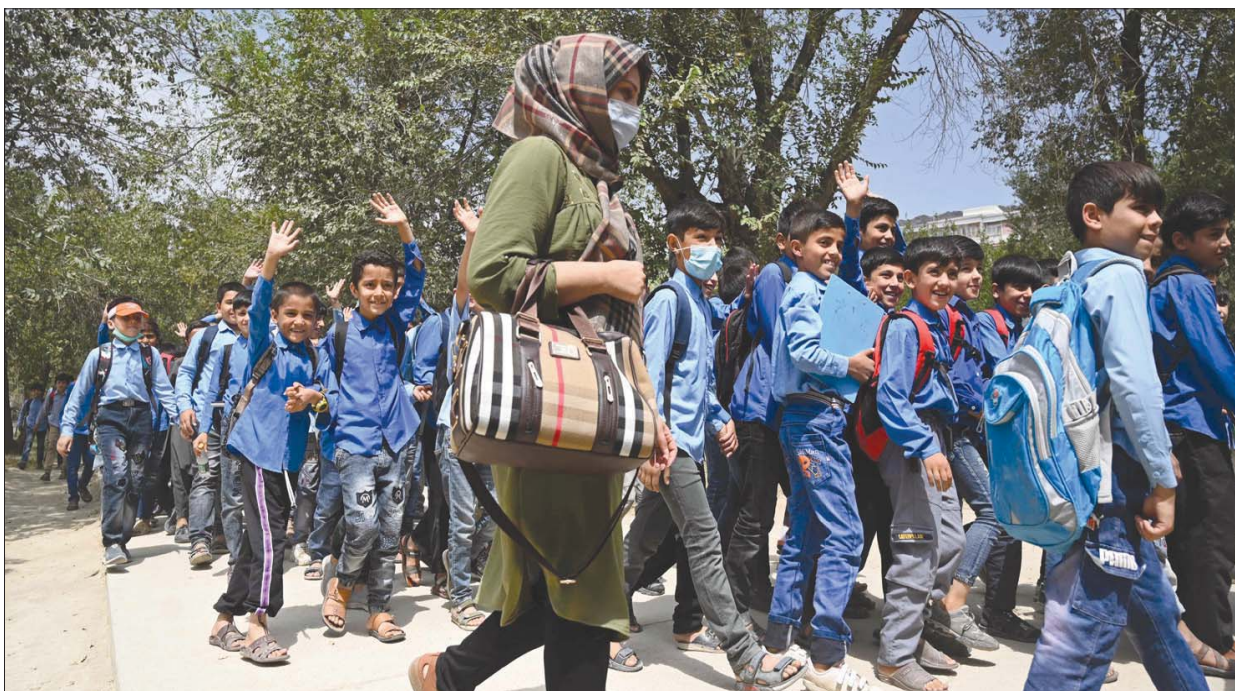
معلمة مع تلاميذها بعد انتهاء اليوم الدراسي في إحدى المدارس الحكومية بكايل أمس