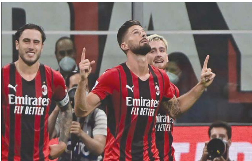
ثنائية جيرو تهدي ميلان فوزاً كبيراً على كالياري