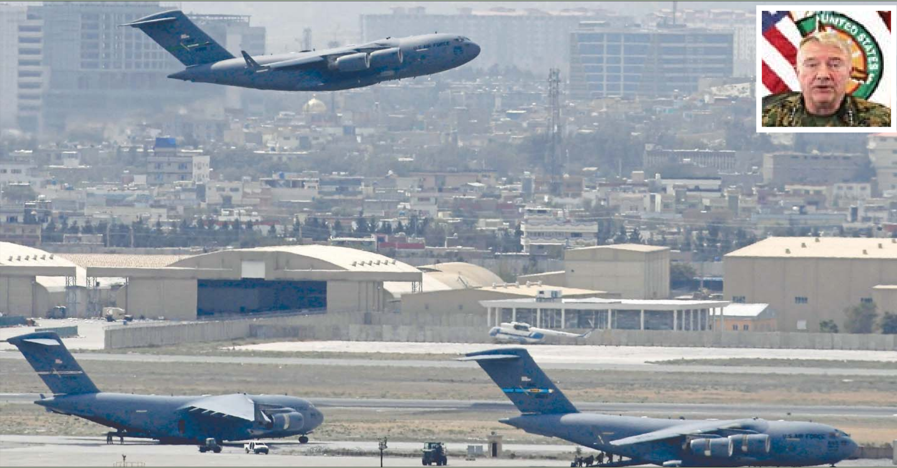
طائرتان عسكريتان أميركيتان على مدرج مطار كابل فيما تقطع طائرة أمس... وفي الإطار الجنرال ماكنتزي يعلن اكتمال الانسحاب من أفغانستان