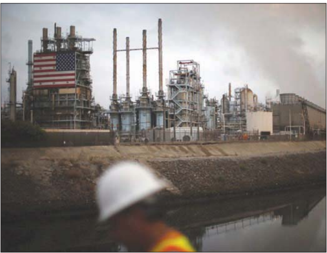
تحركت أسعار النفط صعوداً وهبوطاً أمس أكثر من مرة مع تحركات «أيذا»

العاصفة، وارتفع خام برنت 0,3 في المائة إلى 71,89 دولار للبرميل بحلول الساعة 1533 بتوقيت غرينتش، بعد أن بلغ 73,69 دولار خلال الجلسة، وهو أعلى مستوى منذ الثاني من أغسطس (آب). وارتفع الخام الأمريكي 0,3 في المائة إلى 68,88 دولار للبرميل، بعد أن لامس مستوى 69,64 دولار وهو أعلى مستوى منذ السادس من أغسطس. وقال جيفري هالي كبير محلي السوق لدى أواندا، وفق «رويترز»: «الإعصار أبدأ سيحدث اتجاه النفط في الإمدد القريب جداً... إذا اعتري الضعف أبدأ وبيات مساره التدميري أقل من مستوى إحصار أبدأ سيحدث زخمه مؤقتاً هنا». وبينما انخفض الخام توقعاً لتعاقب سريع للإمدادات، ارتفع البنزين