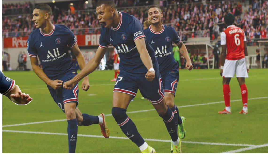
مبابي قدم عرضاً رائعاً ولم يتأثر بالأجواء الاحتفالية حول ميسي

باريس؛ «الشرق الأوسط» شارك ليونيل ميسي بدلاً في الشوط الثاني ليخوض أول مباراته له في دوري الدرجة الأولى الفرنسي لكرة القدم مع باريس سان جيرمان أمام مضيقة ستاد رانس، لكن كيليان مبابي هو من تاللق ليسجل ثنائية ويمتدح فريق العاصمة الفوز 2 - صفر. وأظهر مبابي لسان جيرمان ما قد يخسره الفريق حال انتقاله لريال مدريد، الذي قدم عرضاً للحصول على خدمات مهاجم فرنسا منذ انضمام ميسي في عقد لعامين من برشلونة.