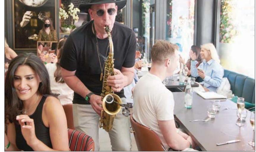
أجواء مفعمة بالموسيقى والحياة

بتخلل الأكل في المطعم زيارة لطيفة لراقص العجينة الذي أصبح صورة مرافقة للمكان، ولكن في الحقيقة فهذا بالفعل لذيقين والعجينة بالفعل فهو راقص قطعة قماش وليس عجيبة كما يظن البعض، ولكنها تبقى لفظة جميلة تحرك الحضور وتؤجج صخب التصفيق فيه