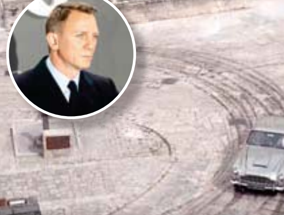
سيارة استون مارتين «د ب 5» خلال تصوير مشهد من فيلم جيمس بوند الأخير «نو تايم تو داي» للممثل دانيال كريغ

وفي الفيلم الذي يؤدي فيه دانييل كريغ للمرة الأخيرة دور العميل السري البريطاني الشهير في القواعد ليمتتع حياة هادئة في جامايكا. لكن راحة باله سرعان ما تنقطع عندما يأتي صديقه القديم ممثل عن تاديتة دور مغني فرقة