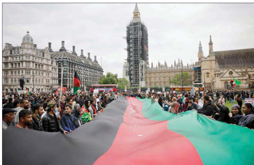
بريطانيون وأفغان يتظاهرون أمام البرلمان بلندن ضد سيطرة «طالبان» على الحكم في أفغانستان