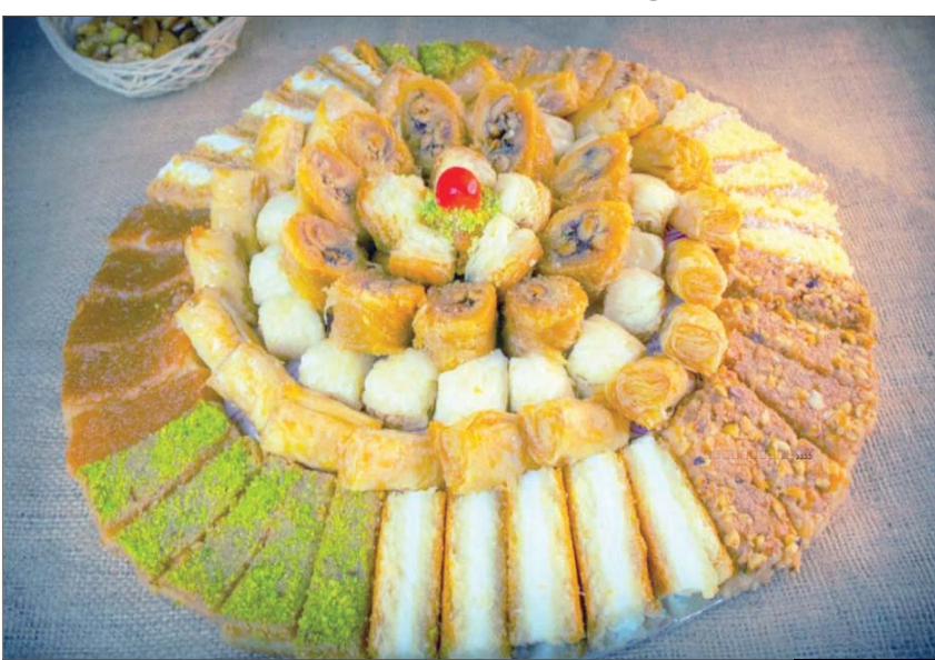
الحلويات الشرقية لدى «حلواني الحلمية» في مصر تجتذب الزبائن من بلدان عديدة

ويشير إلى أن مذاق الحلويات الشرقية لديه يجتذب الزبائن من بلدان عديدة، على رأسها السعودية والإمارات والبحرين، إلى جانب دول الشام التي تشتهر بالحلويات الشرقية، لافتاً إلى أن الـ«بيوتويرز» السعوديان حسين سلام، الملقب بـ«سحس»، وسلمان الفيصل، قاما بالزيارة والتصوير لديهم، مؤكداً أن عشرات الأجانب من دول روسيا وأمريكا وأستراليا وفرنسا والمانيا يأتون خصيصاً إليه لتذوق حلويات «الحلمية»، بعد أن وصلت شهرة مذاقاتها إليهم، بل ويحملونها كهدايا إلى ذويهم مع انتهاء زيارتهم