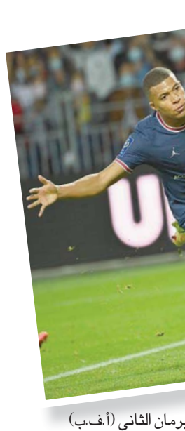
مبابي وهدف سان جيرمان الثاني

متقنة وصلت على أثرها الكرة إلى رومان فافر الذي مرر كرة خلفية رائعة كعب قدمه إلى داخل المنطقة تابعها أونورا زافعة على يمين الحارس الكوستاريكي كيلور نافاس، مسجلاً الهدف من التسديدة الأولى لفريقه بين الخشبات الثلاث في الدقيقة 42. وبقي النادي الباريسي من دون شبك نظيفة للمباراة الثالثة على التوالي، بعد فوزه (2-1) على تروا، و(4-2) على ستراسبورغ، ودفع المدرب بوكيتينو بالألماني يوليان دراكسلر، بدلاً من فيراتي، منخفض الشوط الثاني، قبل أن يسجل غي الهدف الثالث بتسديدة رائعة من على بعد 32 متراً على يمين الحارس فير 73. وكاد روانيال بيار -