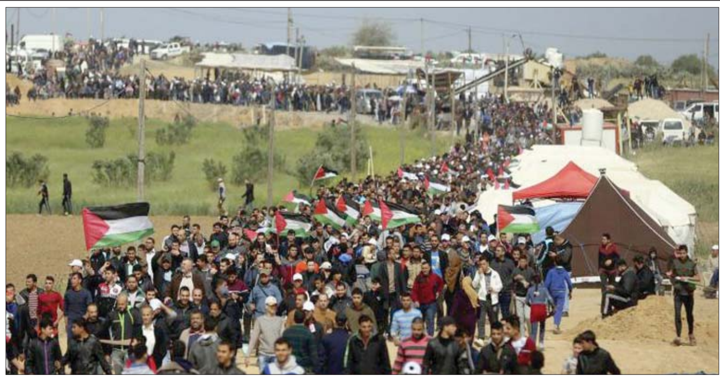
عشرات الغزيين يشاركون في مهرجان بذكرى حرق المسجد الأقصى (غزة الآن)