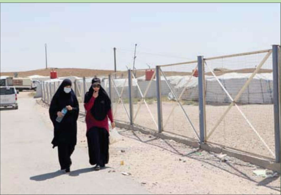
فتاتان في مخيم «روج» شمال شرقي سوريا (التشرق الأوسط)

في غضون ذلك، قالت مصادر في «طالبان» إن نائب زعيم الحركة، الملا عبد الغني برادار، وصل إلى كابل الغني لإجراء محادثات مع أعضاء الحركة، وسياسة آخرين بشأن تشكيل حكومة جديدة. (تفاصيل ص 4)