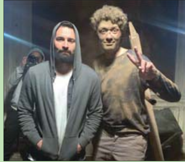
كريم محمود عبد العزيز مع أحمد حاتم تصوير الفيلم