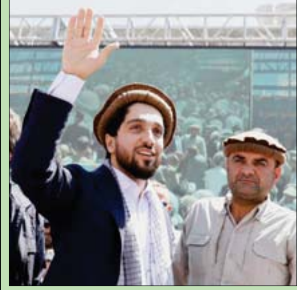
أحمد مسعود

وإذ أكد مسعود أهمية اللامركزية في أفغانستان، فإنه أوضح: «نتحدث معهم بالفعل ونأمل في الوصول لمخرج وإنهاء أي قتال، فهم يقولون إنهم ضد الإرهاب الدولي ولكن يجب أن نرى ذلك بشكل عملي، ونأمل أن يكونوا يرغبون في ذلك بالفعل»، مضيفاً «لا نريد القتال، ومع ذلك، فإننا على استعداد للقتال إذا دخلوا بنجشير. صحيح أنهم يمكنهم الدخول بسلام بدون أسلحة، ولكن في حال دخلوا بالبنادق، فنحن مستعدون للدفاع حتى آخر رجل، ولكن يجب إعطاء السلام فرصة حتى ولو كان هذا السلام مع طالبان». (تفاصيل ص 5)