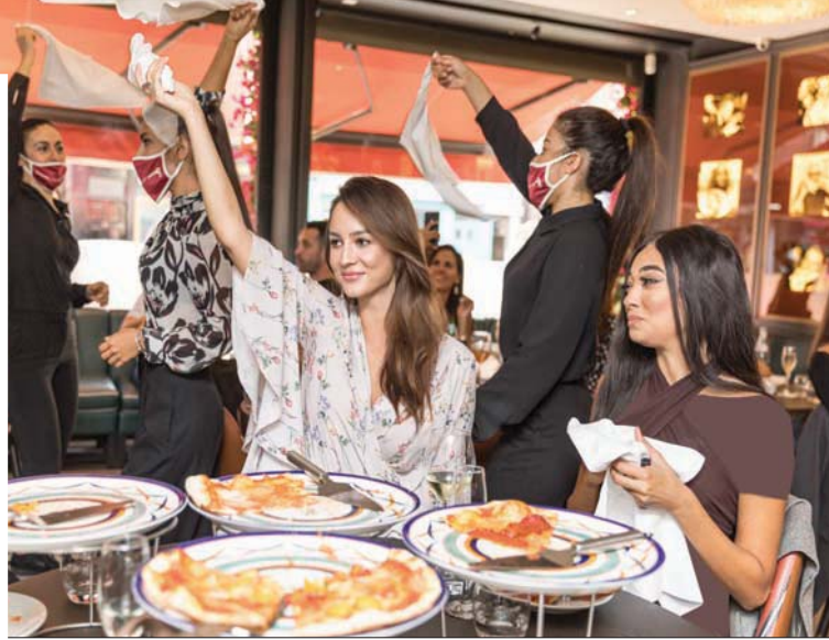
فقررة الرقص مع قطعة القماش «الشرق الأوسط»