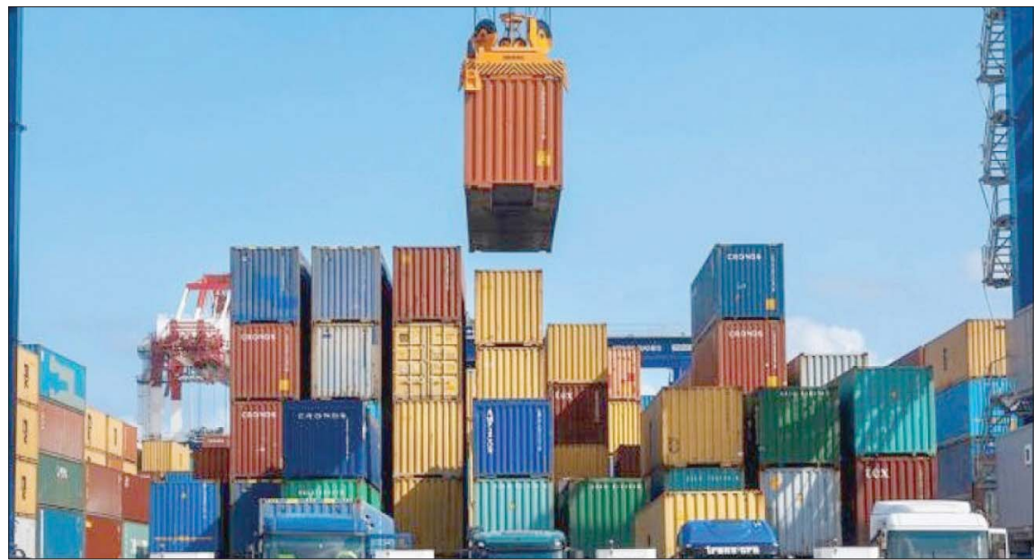
بلغت زيادة الصادرات المصرية في الـ 7 أشهر الأولى من العام 148 مليار دولار مقارنة بالفترة نفسها من العام الماضي

العام الحالي تضمنت: الولايات المتحدة الأمريكية بقيمة مليار 290 مليون دولار، والمملكة العربية السعودية بقيمة مليار 116 مليون دولار، وتركيا بقيمة مليار 81 مليون دولار، وإيطاليا بقيمة 999 مليون دولار، والإمارات العربية المتحدة بقيمة 726 مليون دولار، ومالطة بقيمة 715 مليون دولار، وبريطانيا وأيرلندا الشمالية بقيمة 597 مليون دولار، وليبيا بقيمة 509 ملايين دولار، وإسبانيا بقيمة 609 ملايين دولار، والسودان بقيمة 459 مليون دولار. وأضاف التقرير أن أكبر 10 دول مصدرة للسوق المصرية خلال الـ 7 أشهر الأولى من العام الحالي تضمنت: الصين بقيمة 7 مليارات و582 مليون دولار، والولايات المتحدة الأمريكية بقيمة 3 مليارات و336 مليون دولار، وألمانيا بقيمة مليارين 441 مليون دولار، وتركيا بقيمة مليارين 10 ملايين دولار، وروسيا بقيمة مليار 875 مليون دولار، والهند بقيمة مليار 623 مليون دولار، والإمارات بقيمة مليار 359 مليون دولار، والسعودية بقيمة مليار 216 مليون دولار، وفرنسا بقيمة مليار 17 مليون دولار، وأوكرانيا بقيمة مليار 14 مليون دولار.