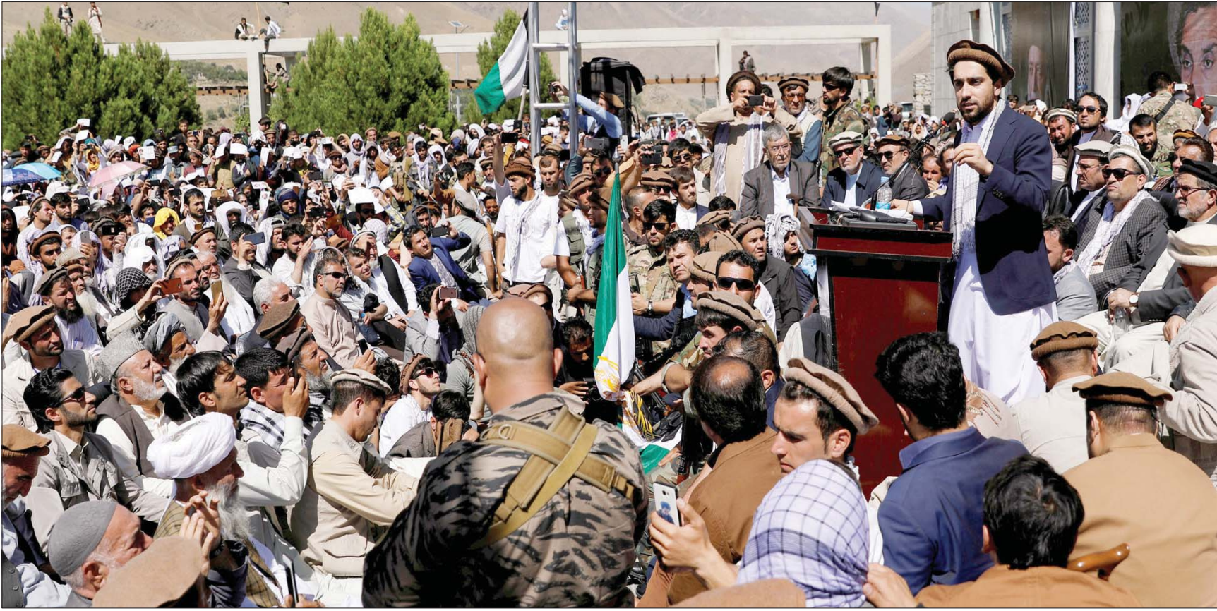
أحمد مسعود يقود «المقاومة» من جديد ضد «طالبان» في إقليم بنجشير شمال كابل