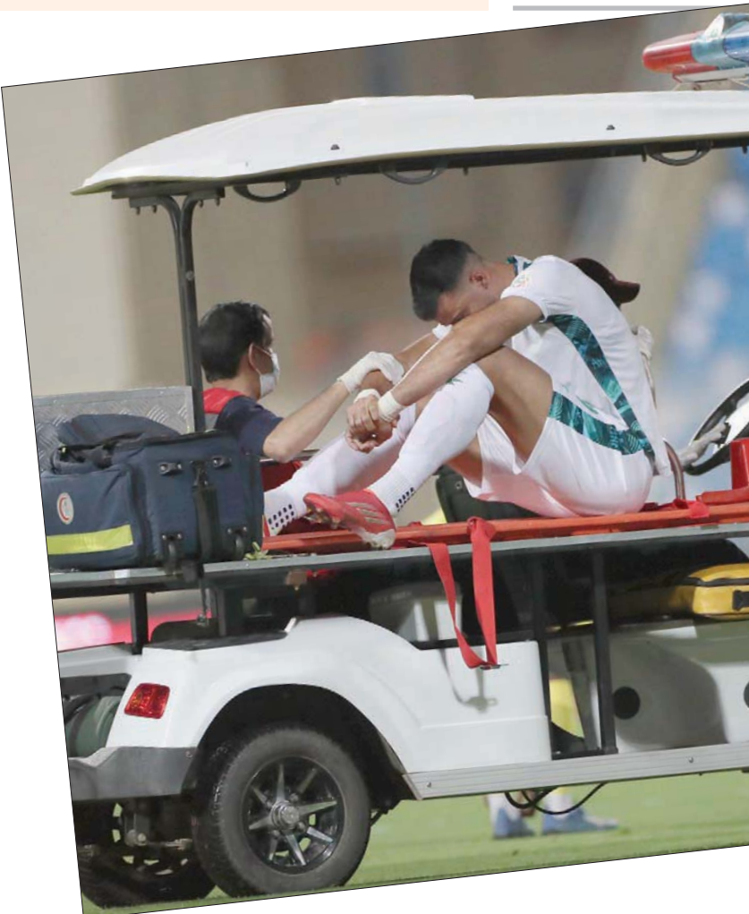
السومة على النقلة الطبية بعد تعرضه للإصابة أمام الحزم

حديداً للفريق لتعزيز تفوقه في موقعة الأربعة المقبل. ومن جهة ثانية، عادت الإحصائيات مجدداً حول رغبة الهلاوية متعددة لضم البرازيلي فريكو الوحدة، خلال فترة الانتقالات الصيفية الحالية، في الوقت الذي أكدت فيه مصادر مطلعة له «الشرق الأوسط» أن مناقشة دعم الفريق بعنصر أجنبي سادس خلال فترة الانتقالات الصيفية الحالية خيار سيكون موهوباً بقرار الجهاز الفني للفريق، بقيادة الألباني هاسي. وانضم البرازيلي أنسيلمو، صاحب الـ32 عاماً، إلى صفوف الوحدة صيف 2019 قادماً من صفوف إنترناسيونال، قبل أن يتم تجديد عقده حتى عام 2024، في الوقت الذي كانت فيه أثناء قد تناولت رغبة اللاعب في الرحيل عن الفريق المكسي، بعد هبوط الفريق لمصاف أندية الدرجة الأولى. ويعد أنسيلمو أحد أفضل لاعبي الوسط المحترفين في الدوري السعودي خلال المواسم الثلاثة الماضية، وقد ارتبط