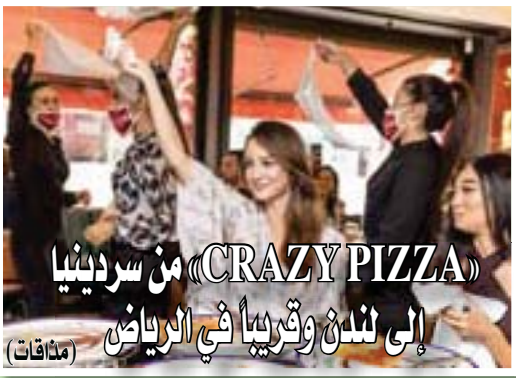
من سردنيا (CRAZY PIZZA) إلى لندن وقربيا في الرياض (مناقشات)