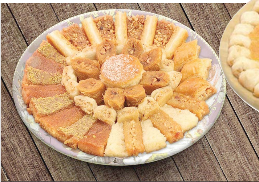
في أحد أحياء القاهرة العريقة، الذي ارتبط بعالم الدراما التلفزيونية، يكتب «حلواني الحلمية» شهرة كبيرة

فالبسبوسة على سبيل المثال يجدها الزبون غارقة في السمن، كما أننا لم نغير نوع السمن المستخدم في كل الحلوى منذ عقود».