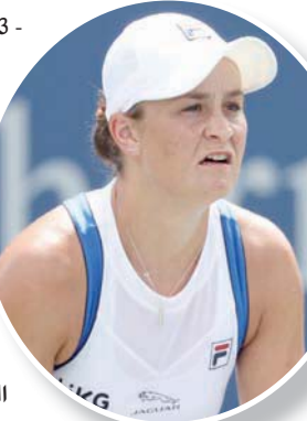
الروسي دانييل مدفيديف

إلى ثاني القابها في البطولات الكبرى بعد فرنسا المفتوحة 2019. قالت بعد الفوز: «أشعر وكأنني قمت بعمل جيد على إرسالي، في جميع أشواط إرسالي باستثناء واحد، شعرت بأنني أحكمت سيطرتي». وتلتقي بارتني (25 عاماً) في دور الأربعة مع الألمانية أنجليك كيربر التي تأهلت على حساب التشيكية بتر كفيوتوفا بعد انسحاب الأخيرة إلى رابع الوسط ماركو فيراتي بسبب إلام في المعدة. ووصلت بارتني إلى سينسيناتي بعد خروج مخيب من الدور الأول في أولمبياد طوكيو، حيث كانت أبرز المرشحات للفوز بالذهبية، قبل أن تعوض بيرونيزية الزوجي المختلط، فيما حققت كرايتشيكوفا ذهبية زوجي السيدات. وتامل بارتني في أن تستعد بأفضل طريقة لبطولة الولايات المتحدة المفتوحة التي تنطلق أواخر