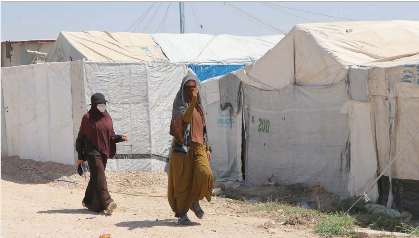
سيدتان في مخيم روج شمال شرقي سوريا (الشرق الأوسط)

وبعض المواد الأساسية وأوانعاً من العطور والماكياج، وقالت في حديثها: «كثير من النساء هنا يشترين العطور والماكياج، على الرغم من أن نساء متشدات اعتدين على أخريات بسبب وضع مساحيق التجميل ولبس السراويل وبطلونات الجينز». وأعربت سيدة مغربية (35 سنة) تتحدر من مدينة تطوان الساحلية المطلّة على شواطئ البحر المتوسط، والأّن تعيش وأطفالها في مخيم تصل درجات الحرارة فيه هذه الأيام إلى 45 درجة مئوية، عن أنها تحلم بالعودة إلى بلدها، وتنتظر بفارغ الصبر لحظة وصولها، بعد مضي 6 سنوات لها بسوريا، منها 5 سنوات عاشتها بالتخلّق بين مخيمات الهول وروج، فيما رفضت مواطنة مصرية العودة لبلدها خشية من الملاحقة الأمنية، وأن ملف زوجها الذي التحق بالتنظيم بداية 2015، وحارب في صفوفه، سيعكس سلباً على مستقبل أطفالها ودراساتهم وإكمال حياتهم بشكل طبيعي، وأنها ستقدم طلباً للجوء لدولة ثالثة لتقبلهم.