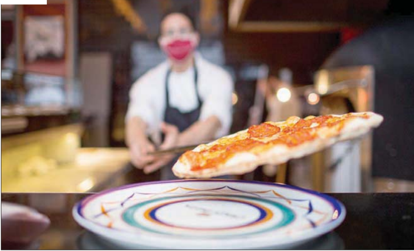
البيتزا خالية من الخميرة مما يجعلها خفيفة جداً

بالنسبة للأسعار، ليست الأرخص في لندن ولكن النوعية والمنتج الإيطالي يعلان ثمنها المتوسط.