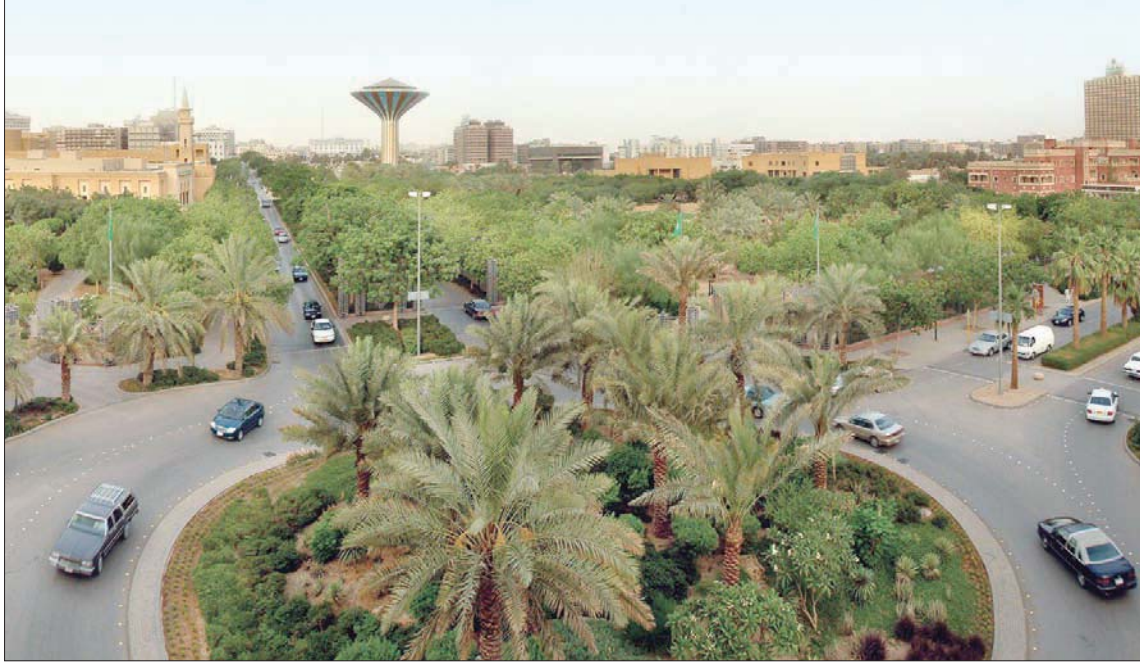
المبادرة الخضراء تحفز شركات تقنيات الزراعة والأسمدة لدخول السوق السعودية (الشرق الأوسط)

هذه المرحلة يرفع إنتاج المملكة إلى 9 ملايين طن سنوياً، لتصبح المملكة ثاني أكبر منتج للأسمدة الفوسفاتية في العالم. من ناحيته، أوضح الدكتور إبراهيم التركي رئيس اللجنة الوطنية للزراعة وصيد الأسماك أن القطاع الزراعي السعودي يعج بالفرض الكامنة، حيث تظهر الفرص مع رؤية المملكة التي تستهدف