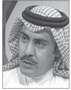
د. خالد بن نايف الجبير

تسارعت وتطورت الأحداث في أفغانستان بشكل درامي ومختلف عما كان يتوقع أو يرغب كثيرون حول العالم، انتهى بسيطرة «طالبان» على البلاد للمرة الثانية، فيما استسلم الجيش الأفغاني وهرب كبار المسؤولين في الحكومة، وأصاب الهلع السكان في كابل. كيف حصل ذلك وما مسبباته، والأهم من ذلك ما تداعياته الداخلية والإقليمية والدولية؟