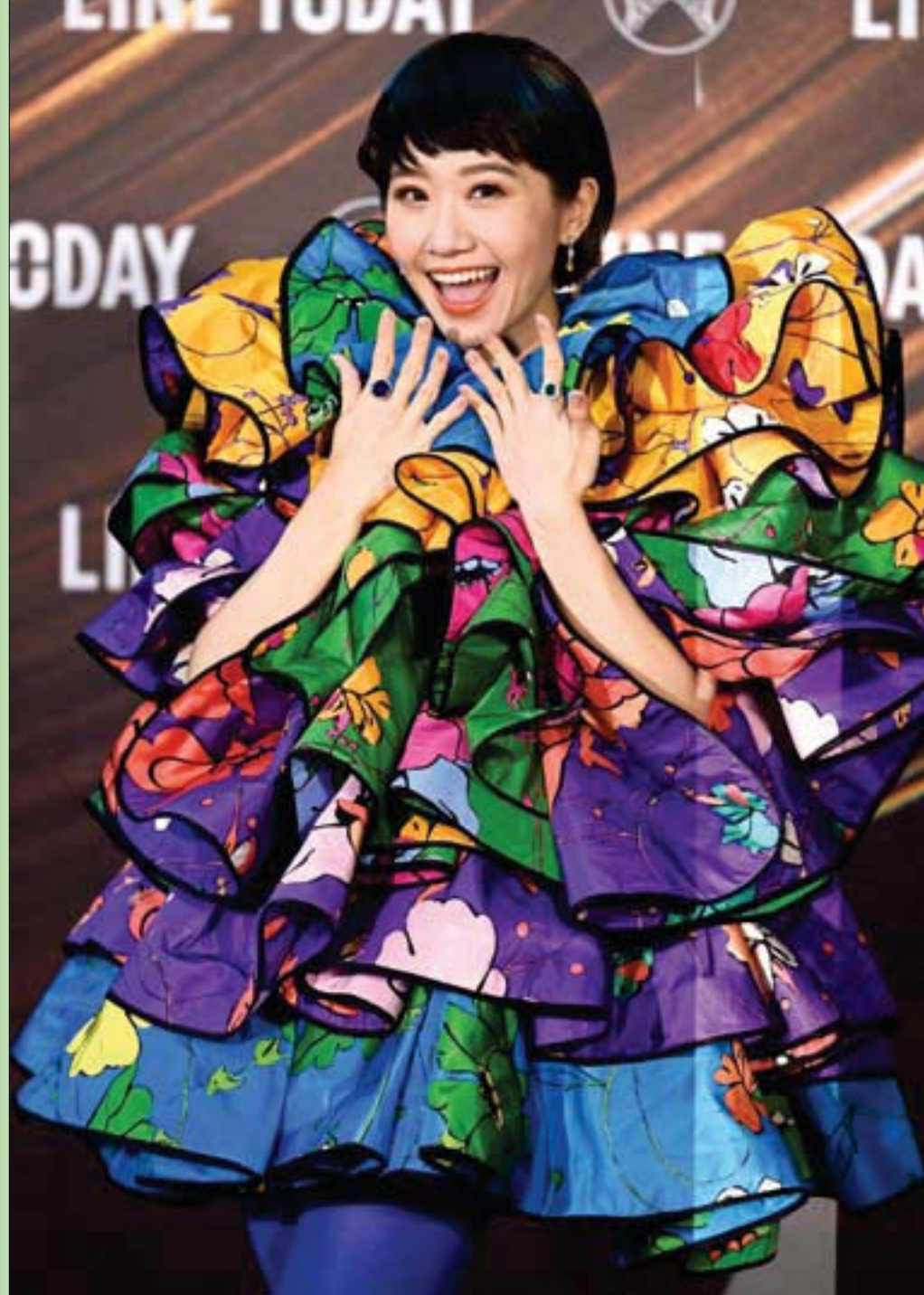
المغنية التايوانية لولو حضرت حفل توزيع جوائز «غولدن ميلودي» في تايبيه (أ.ف.ب)

ولكن مهما كان: الأعمار بيد الله، ولكل أجل كتاب.