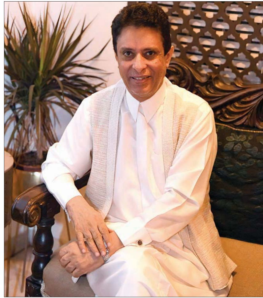
الفنان الموسيقار اليميني أحمد فتحي

ويشير فتحي إلى نجاح حفلاته مع الفنان عبادي الجوهري، قائلاً: «عندما تم