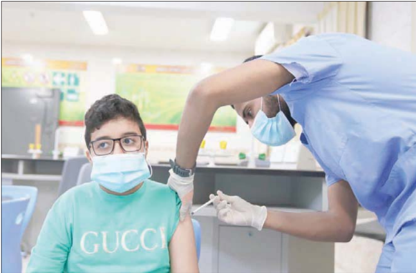
حصول الفئات العمرية من 12 عاماً على اللقاح

وأصدر الدكتور حمد آل الشيخ وزير التعليم السعودي، أمس، تعميماً للجامعات والمؤسسات العامة للتدريب التقني والمهني وإدارات التعليم وقطاعات الوزارة المختلفة؛ حول البروتوكولات الوقائية المتعلقة بعودة التعليم حضورياً، والمبلغة من قبل «وقاية»، وذلك للعمل بموجبها، ومتابعة تنفيذها من جميع قطاعات التعليم والتدريب المختلفة الحكومية والأهلية. وتضمنت البروتوكولات الملغاة: الدليل الإرشادي الوقائي للعودة إلى المدارس في ظل جائحة كورونا، والية التعامل مع الحالات المؤكدة والمشتبهة في المدارس، إلى جانب الدليل الإرشادي لعودة الطلاب والكوادر