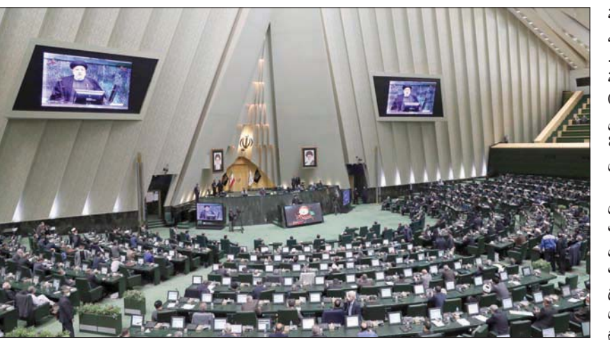
رئيسي قدم أعضاء حكومته لجلس الشورى (البرلمان) في جاسته أمس

وقال تقرير نشرته مجلة «ناشيونال إنترست» الأميركية إنه بطبيعة الحال، تركزت جهود بايدن وحكومته على تجديد المفاوضات مع طهران».