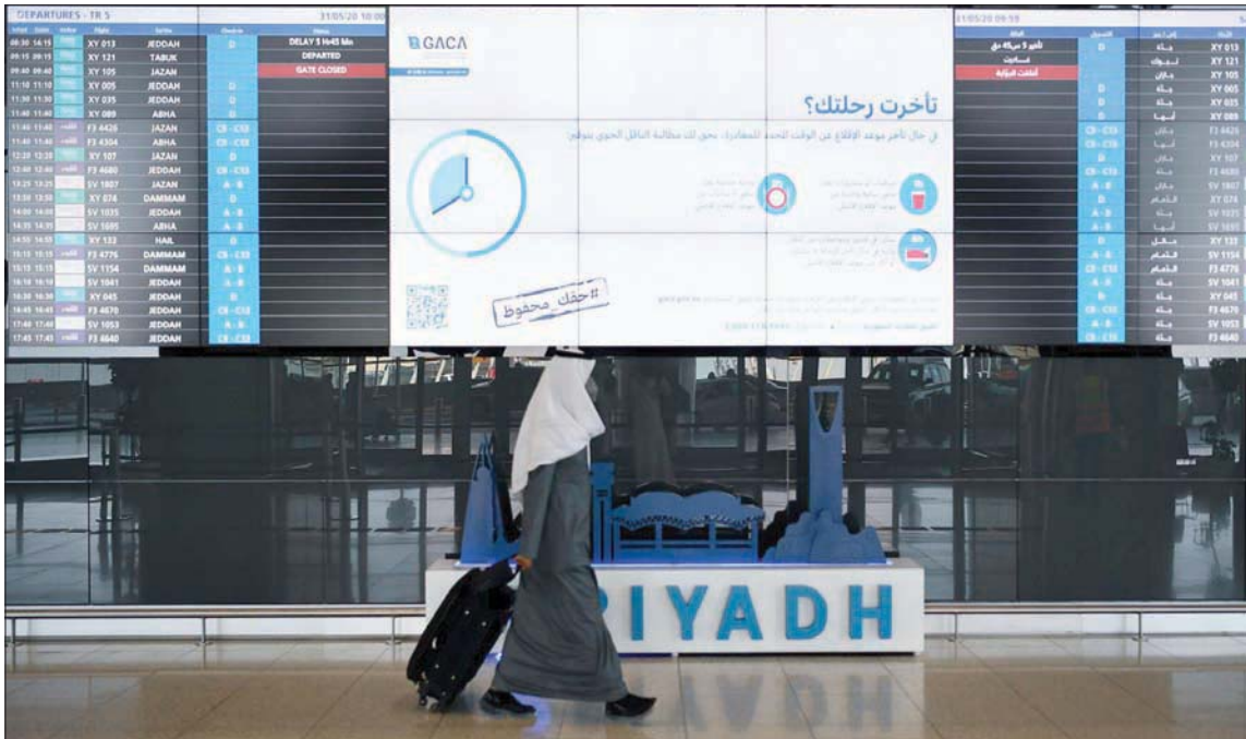
عودة حيوية لقطاع الطيران السعودي وفق الاحترازية الصحية

المستمر في القطاع لـ«الشرق الأوسط»، إن السعودية نجحت في السيطرة على وباء جائحة «كورونا» وتعاملت معه باحترافية عالية أوصلها إلى نسب تلقح كبيرة بين أفراد المجتمع المحلي، مع انخفاض في معدل الإصابة، وهذا عامل مهم في تحسين الأداء الاقتصادي بشكل عام منها قطاع الطيران. وأضاف أن مع الية رفع التواعد في مقاعد الطائرات التي جاء بناءً على طلب من الشركات