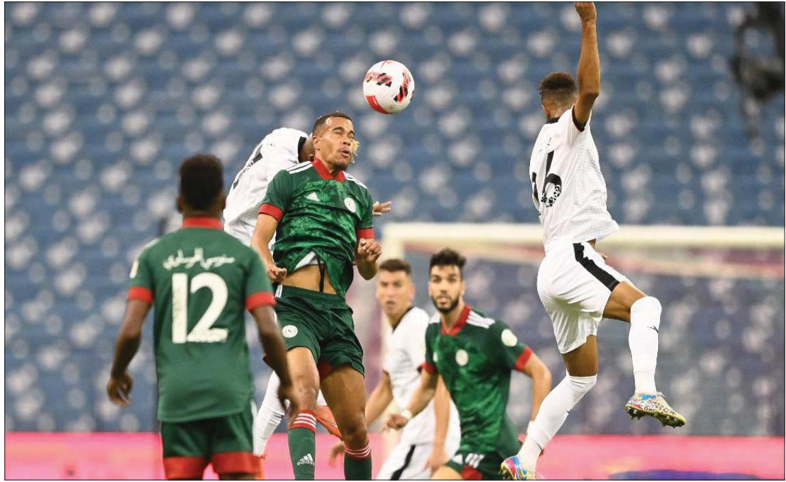
من مواجهة الشباب والاتفاق أسس في الرياض

كهدف ثالث مع الدقيقة 49 وتمكن الاتفاق من تقليص الفارق مع الدقيقة 77 من عمر المباراة عن طريق المغربي وليد