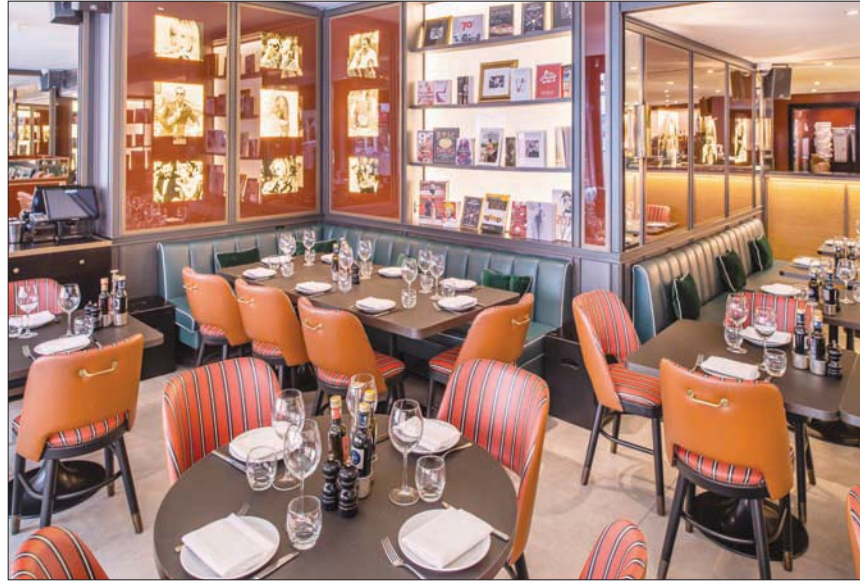
المطعم من الداخل

ومن المنتظر افتتاح فرع جديد في السعودية وآخر في قطر وهناك فرعان للمطعم في موناكو وسربدينيا.