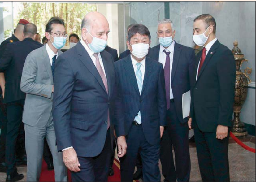
وزير الخارجية العراقي فؤاد حسين مستقبلاً نظيره الياباني توشيميتسو موتيجي في بغداد أمس

وقالت الهيئة في بيان لها إن «هذه العملية تؤكد بما لا يقبل الشك أن الإرهاب لا يزال ينشط ويتحرك على تخوم العاصمة، وفي أخطر منطقة فاصلة بين بغداد وصلاح الدين والأنبار».