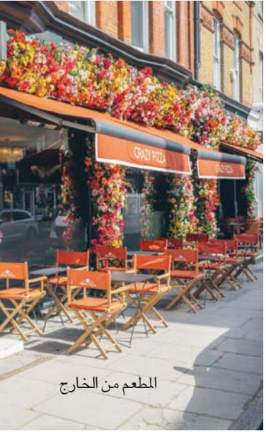
المطعم من الخارج