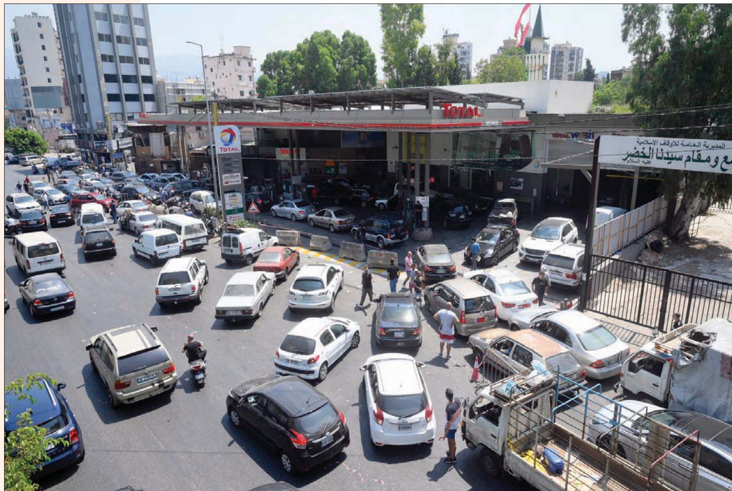
بيروت، الشرق الأوسط