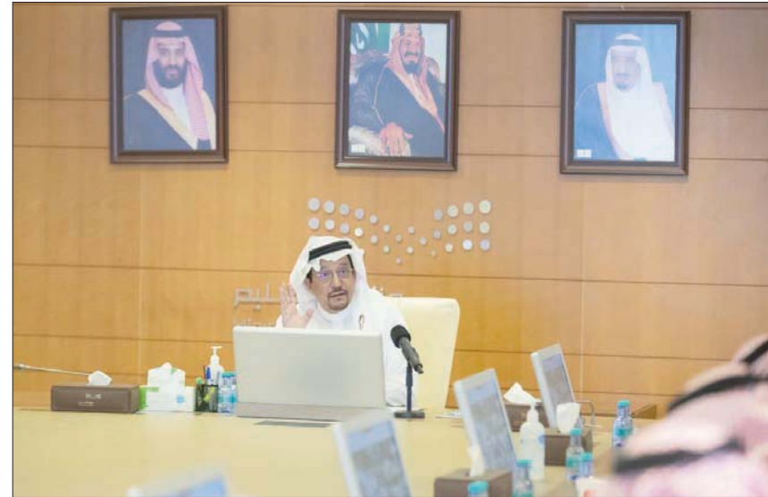
وزير التعليم حمد آل الشيخ خلال اجتماعه أمس بمديري التعليم بمناطق ومحافظات المملكة

وتشترط العودة الحضورية للتعليم في الموسم الدراسي الاستثنائي الجديد على الحصول على جرعتين من اللقاح للدخول للمنشآت التعليمية، في الوقت الذي سيمنع غير مكتملي التحصين من الدخول للمنشآت التعليمية وسيحسب طلبة التعليم العام لمن أكمل 12 سنة ميلادية متغيباً حتى استكمال التحصين بجرعتين، كما لن يتم السماح لطلاب التعليم الجامعي والتدريب غير مكتملي التحصين من الحضور وسيتم إيقاف تسجيلهم وإعابهم من تسجيلين حتى استكمال الجرعة الثانية. وتسبق مباشرة المعلمين اليوم في مدارسهم عودة الطلاب والطالبات يوم الأحد المقبل وفق البات العودة الحضورية للعام الدراسي 1443هـ، مع تطبيق الإجراءات الاحترازية والتدابير الوقائية للحفاظ على صحة وسلامة الجميع.