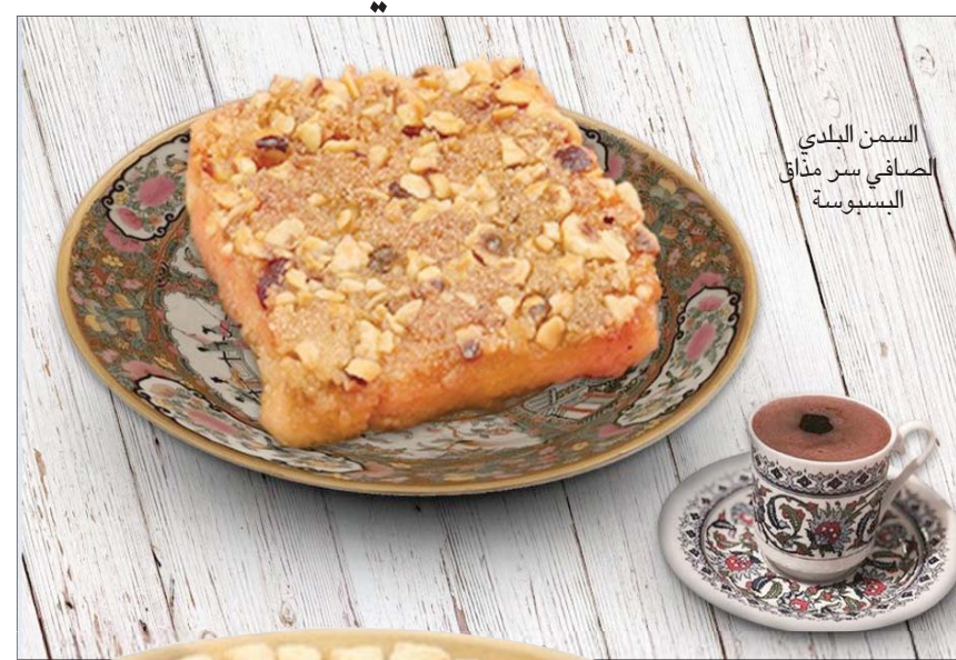
السمن البلدي الصافي سر مذاق البسبوسة