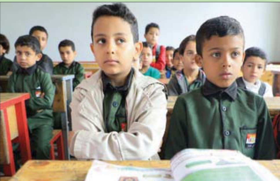
تلاميذ بمدرسة في صنعاء، حيث يخشى أولياء الأمور من تلاحق حوثي في مناهج الدراسة

وانتقد وزير الإعلام اليمني ما وصفه بـ«صمت المجتمع الدولي