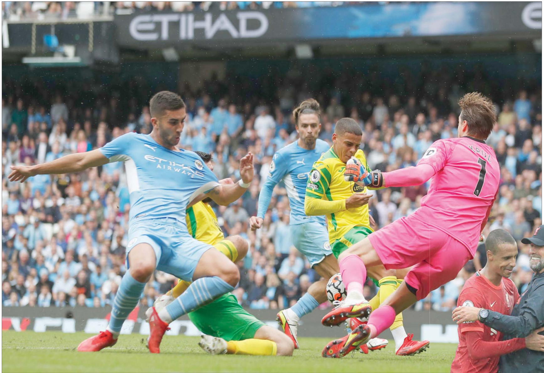
غريليش (وسط) يعزز تقدم مانشستر سيتي

لحق فريق مانشستر سيتي ضيفه نوريتش سيتي درسا في فنون كرة القدم وتغلب عليه 5 - صفر خلال المباراة التي جمعتهما أمس في الجولة الثانية من الدوري الإنجليزي. وشهدت أيضاً هذه الجولة فوز ليفربول على بيرنلي 2 - صفر، وأستون فيلا على نيوكاسل 2 - صفر، وتعادل كريستال بالاس مع برينتفورد سلبيا، وليدز يونايتد مع إيفرتون 2-2. وسجل إيمريك إيفرتون في الدقيقة السابعة عندما تسلم غابرييل جيسوس الكرة خلف مدافعي نوريتش سيتي داخل منطقة الجزاء ليتمر كرة عرض الملعب حاول غرانث هانلي إبعادها لتصل بمسد الحارس تيم كرول قبل أن تعانق الشباك. وجاء الهدف الثاني في الدقيقة 22 عندما مر جيسوس كرة عرضية أرضية داخل منطقة الست ياردات لتصل بمقدم جاك غريليش قبل أن تعانق الشباك. وسجل إيمريك إيفرتون في الدقيقة 64 عندما لعبت ركلة ركنية داخل منطقة جزاء نوريتش لتحدث حالة من الارتباك قبل أن تنتهي الكرة أمام لايبورت الذي قابلها بتسديدة إلى داخل المرمى. وفي الدقيقة 71 سجل ريجيم سترايغنج الهدف الرابع عندما مرر جيسوس كرة عرضية أرضية من الجانب الأيمن قابلها سترايغنج بتسديدة إلى داخل المرمى. واختتمت رياض محرز أهداف مانشستر سيتي الخمسة في الدقيقة 83 عندما تسلم كرة طويلة خلف مدافعي نوريتش داخل منطقة الجزاء ليسدد الكرة أرضية اصطدمت بالطاقم الأيمن قبل أن تعانق الشباك. وحصد مانشستر سيتي، حامل اللقب، أول ثلاث