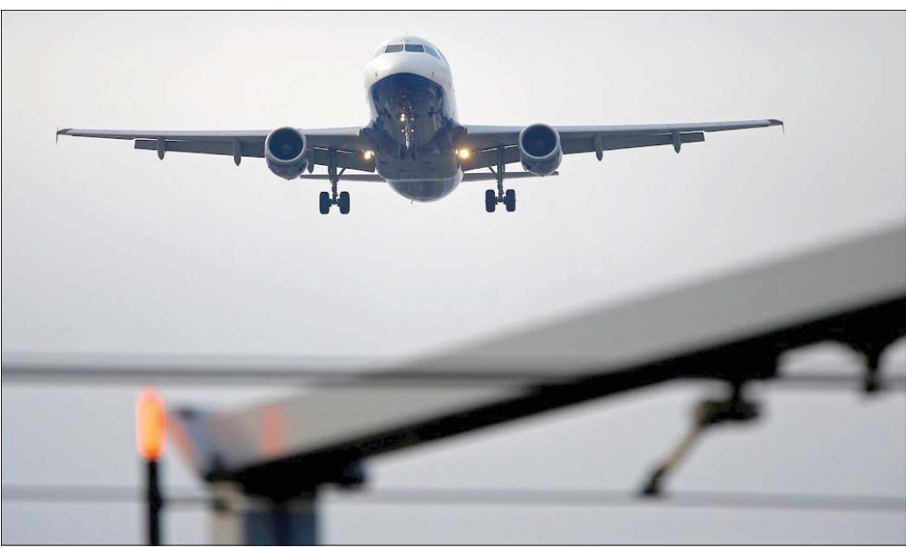
لبنان وبنغلاديش ونيجيريا وزيمبابوي من بين الدول الأكثر مديونية لشركات الطيران (رويترز)

الطيران في البلاد التي ما زالت تعاني بسبب حالة عدم اليقين.