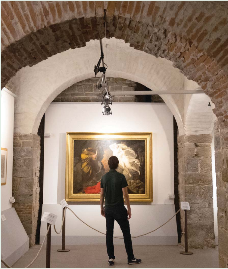
يعبر متحف «يوفيزي» في فلورنسا الأعمال الفنية من مستودعاته إلى أصغر المدن في جميع أنحاء توسكانا ما زاد من جاذبيتها وتعزيز روابطها مع المنطقة