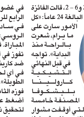
الأسترالية أشلي بارتني