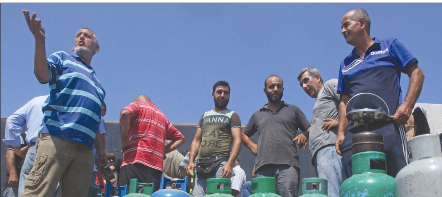
لبنانيون ينتظرون أسس لتعبئة قوارير الغاز المنزلي

بيروت، الشرق الأوسط، الرزمت أزمة انقطاع مادة المازوت بعض المطاحن بالتوقف عن العمل أمس، ما يهدد بأزمة خبز في البلاد، في حين برزت أزمة جديدة تمثلت بالشح في مادة الغاز الذي يُستخدم في المنازل، وتجددت الطوابير أمام محطات تعبئة السيارات بالبنزين. وأعلن تجمع المطاحن في لبنان أمس توقف العديد من المطاحن قسرياً عن العمل بسبب فقدان مادة المازوت التي باتت غير متوافرة في السوق الشرعية