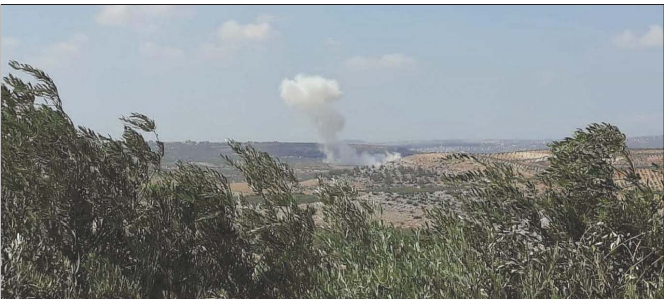
قصف جوي روسي على مناطق جبل الزاوية بريف إدلب