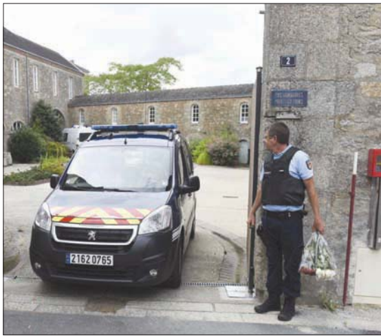
سيارة شرطة تغادر مدخل كنيسة بلدة سان لوران سور سيفر الواقعة غرب فرنسا حيث قتل الكاهن الكاثوليكي أوليفيه مير أول من أمس (أ.ف.ب)

وحسب يانك لوغوثير، نائب مدعي عام المنطقة الذي استبعد العمل الإرهابي، فإن حالة المتهم بارتكاب الجريمة وصحته العقلية، لا تسمحان باستجوابه. وينتظر أن يعقد الطب الشرعي إلى شتى جثة القتيل للتحقق من الظروف الحقيقية للمقتل. وفتح نائب المدعي العام تحقيقاً قضائياً بتهمة «القتل العمد» ضد أبايسينغا، ورغم العطلة الصيفية وغياب الكثير من السياسيين عن العاصمة، فإن الجريمة الجديدة أشرت، من جهة، سبلاً من الأساليب، ومن جهة أخرى جدلاً واسعاً بين الحكومة والمعارضة بشقيها اليمين الكلاسيكي واليمين المتطرف. وتتمتع الأوساط الرئيسية التي طرحت بقوة الأسباب التي حالت دون تنفيذ أوامر الإبعاد المنصوص عليها في اتفاقية جنيف، بحق أبايسينغا، والأسباب التي حثت قاضي التحقيق في مسألة حريق كاتدرائية نانت