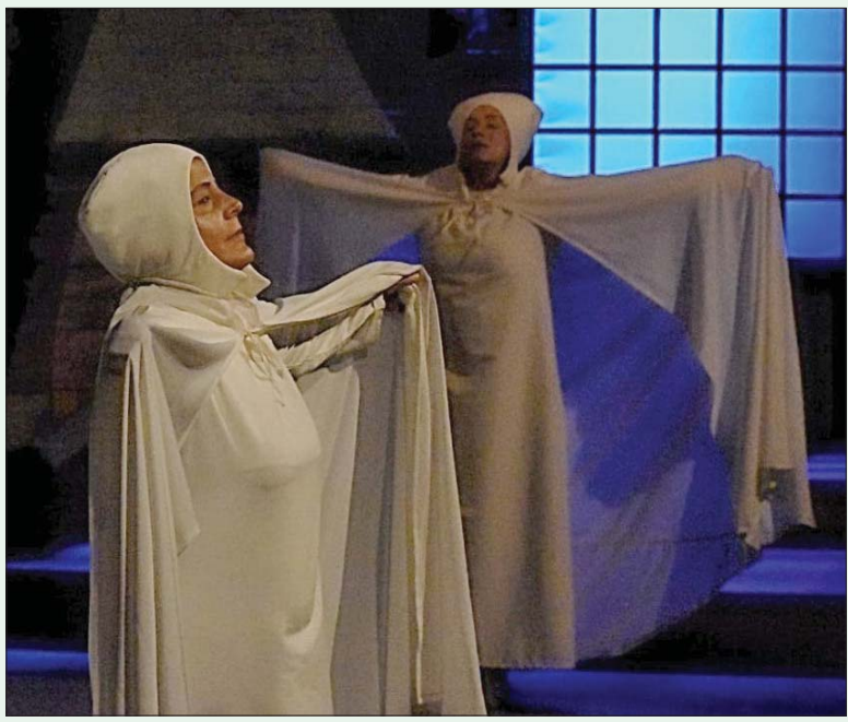
لقطة من مسرحية «سيدة الفجر»

ففي حين يتوافد المتفرجون إلى قاعة العرض، يفاجون بأنه لا توجد خشبة عرض، فالمكان هنا ينتمي إلى ما يعرف بـ«مسرح الغرفة»، حيث يتحطم الحاضر الوهمي بين الجمهور والممثلين ويوجد الطرفان في غرفة واحدة بلا فواصل أو حواجز، لم يبدأ العرض