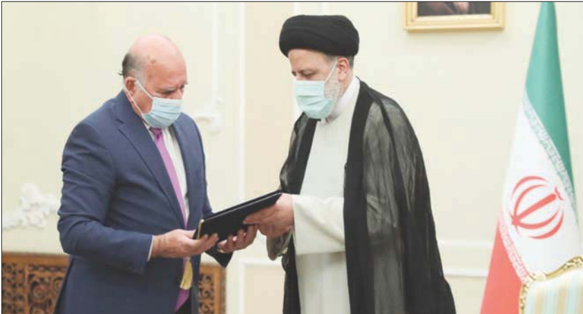
الرئيس الإيراني إبراهيم رئيسي مستقبلاً وزير الخارجية العراقي فؤاد حسين أمس

الكهربائية العراقية، أحمد موسى العبادي، في تصريح أدلى به لـ«الشرق الأوسط»، قال فيه: «الأمر ليس بجديد، تعليق إيران إمدادات الكهرباء حدث قبل 3 أشهر، بعد أن قامت طهران بإيقاف خطوط الأربعة الرئيسية المجهزة للعراق». ولم يخض العبادي في