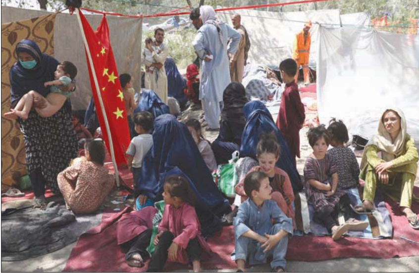
عائلات أفغانية فرت إلى كابل من جحيم المعارك مع «طالبان» في الشمال الأفغاني أمس

وقال مسؤولون إن الهند أرسلت طائرة إلى شمال أفغانستان لنقل رعاياها إلى أرض الوطن، وطلبت من الهنود المغادرة. ونصحت الولايات المتحدة وبريطانيا مواطنيها بالبقاء في أفغانستان. واستستعملت الولايات المتحدة سحب قواتها بحلول نهاية الشهر بموجب اتفاق مع «طالبان» يشمل سحب القوات الأجنبية في مقابل تعهد الحركة بتمنع استخدام أفغانستان قاعدة للإرهاب الدولي. وتعددت «طالبان» بعدم مهاجمة القوات الأجنبية المنسحبة، لكنها لم توافق على وقف لإطلاق النار مع القوات الحكومية، ولم تسفر المفاوضات بين الطرفين عن شيء. ومزار الشريف مدينة تاريخية ومفترق طرق تجاري. وهي من الدعائم التي استندت إليها الحكومة للسيطرة على شمال البلاد. ويستتدل سقوطها ضربة قاسية جدا للسلطات. وقد يكون عجز السلطات في كابل عن السيطرة على شمال البلاد أمراً حاسماً لفرص مقاومة عندما وصلوا إلى السلطة في التسعينات. حكمت «طالبان» البلاد بين عامي 1996 و 2001 وفرضت الشريعة بتفسيرها الصارم لها، قبل أن يطيحها تحالف دولي بقيادة الولايات المتحدة.