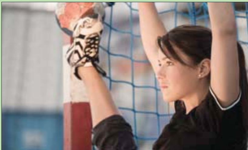
كليوباترا حارسة المنتخب الفرنسي لكرة اليد

تضع عينها على الدورة الأولمبية المقررة في اليابان. وإلى جانب تدريباتها الشاقة، فإنها ناشطة متحمسة في مجال الدفاع عن بطلات الرياضة من النساء. وكانت أول رياضية فرنسية محترفة توقع على وثيقة تتعلق بحقوق اللاعبات الأمهات. فقد جرت العادة أن تمتنع بطلات الرياضة عن الإنجاب خشية فقدان لياقتهن وانصراف الراعين عنهن. تابعت أعين الفرنسيين بطلتهن وهي تسد الشباك في دورة طوكيو بيديها وساقها ورأسها، وتقفز في كل الاتجاهات لتمنع كرة الفريق الخصم من دخول شبكتها. وسرعان ما تحولت كليوباترا إلى نجمة تلاحقها الكاميرات في بلادها وتنشر الصحف أخبارها وصورها مثل الممثلات والمطربات. وقد ساعد على ذلك قوامها الفارع الرشيق وجمال وجهها. وإلى جانب احترافها الرياضة، فإنها تهوى الطبخ وقد افتتحت مطعمًا للبيتزا في بريست، المدينة الواقعة على الساحل الغربي لفرنسا، حيث تلعب لناديها حالياً.