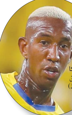
تاليسكا