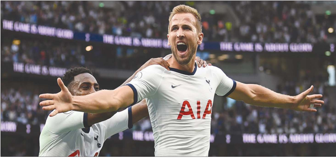
سيكون من الصعب للغاية إيجاد بديل لهاري كين بأهدافه الحاسمة

أما الجانب السلبي فيما يحدث حالياً فهو الإضرار بسبعة كين، الذي بنى مسيرته الكروية على العمل بكل قوة وعدم الالتفات إلى الانتقادات والضوضاء والسعي المستمر لتسجيل الأهداف، وهي الصفات التي كان يُنظر إليها بالطبع على أنها شيء إيجابي للغاية. لكن الآن لم يعد الأمر يسير بهذه الطريقة. قد يكون قرار كين بالتعبير عن التديرات نابعا من إحباطه الشديد وشعوره بالوقوع في الفخ عندما وقع على عقد جديد مع توتنهام لمدة ست سنوات في عام 2018، وعدم نجاحه في الضغط على مسؤولي توتنهام من أجل الرحيل. لقد أراد كين أن يرحل الصيف الماضي، لكن ليفي وقف في طريقه، وبات هناك كثير من التنازلات التي سمح لها بالرحيل. ربما تعلم كين درساً من التاريخ، بعد أن رأى ما قام به نجوم توتنهام السابقون من أجل السماح لهم بالرحيل. لقد رفض ليفي الإفصاح عما إذا كان ديميتار برباتوف قد دخل في إضراب لينتقل إلى مانشستر يونايتد في 2008، أم لا - غاب المهاجم عن مباراتين