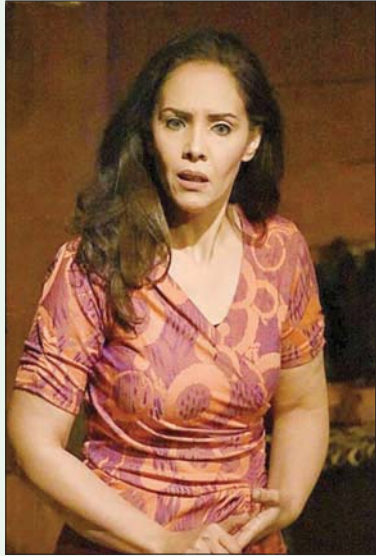
العرض المصري يبرز الموت في صورة بشرية

القاهرة، رشا أحمد يرتبط الموت في أذهان البشر بالدموع والخوف والرهبة، فهو مصيبة المصائب وقمة الأحران، لكن ماذا لو كان الأمر غير ذلك؟ ماذا لو كان الموت نفسه كأنثى يحمل شيئاً من المشاعر الإنسانية؟