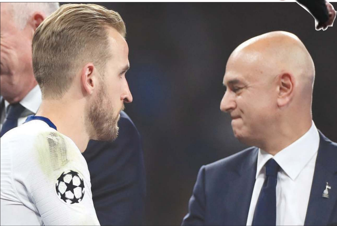
كين وليفى لعبا دوراً كبيراً في الملحمة المستمرة لانتقال مهاجم إنجلترا إلى مانشستر سيتي (غيتي)

أصبح واضحاً أن كين يرغب في الرحيل عن توتنهام (غيتي)