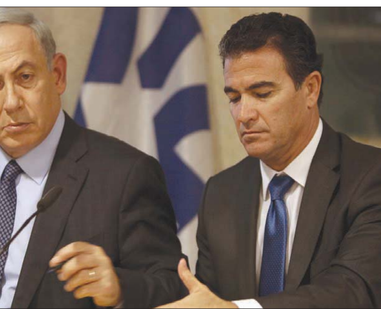
يوسي كوهين رئيس الموساد السابق ورئيس الوزراء نتنياهو عام 2015

مصالح مبادرين ورجال أعمال، مقابل حصوله على أموال نقداً ومناقص شخصية بمبلغ يصل إلى مئات آلاف الشواقل. وتورط معه 15 متهماً آخرين. وأشارت لائحة الاتهام إلى أن هذه القضية تكشف وجهاً قبيحاً للقيادة السياسية والمحلية في المجتمع الإسرائيلي، وتبين كم هو الفساد متجذر في المؤسسات، وكم هم السياسيون مستعدون لدفع رشى وتلقي رشى. وأكدت أن الحكم في هذه القضية يجب أن يكون ملائماً لتعلم الدرس، وردع المسؤولين عن الوقوع في جبايل الفساد واقتلاع الظاهرة من جذورها.