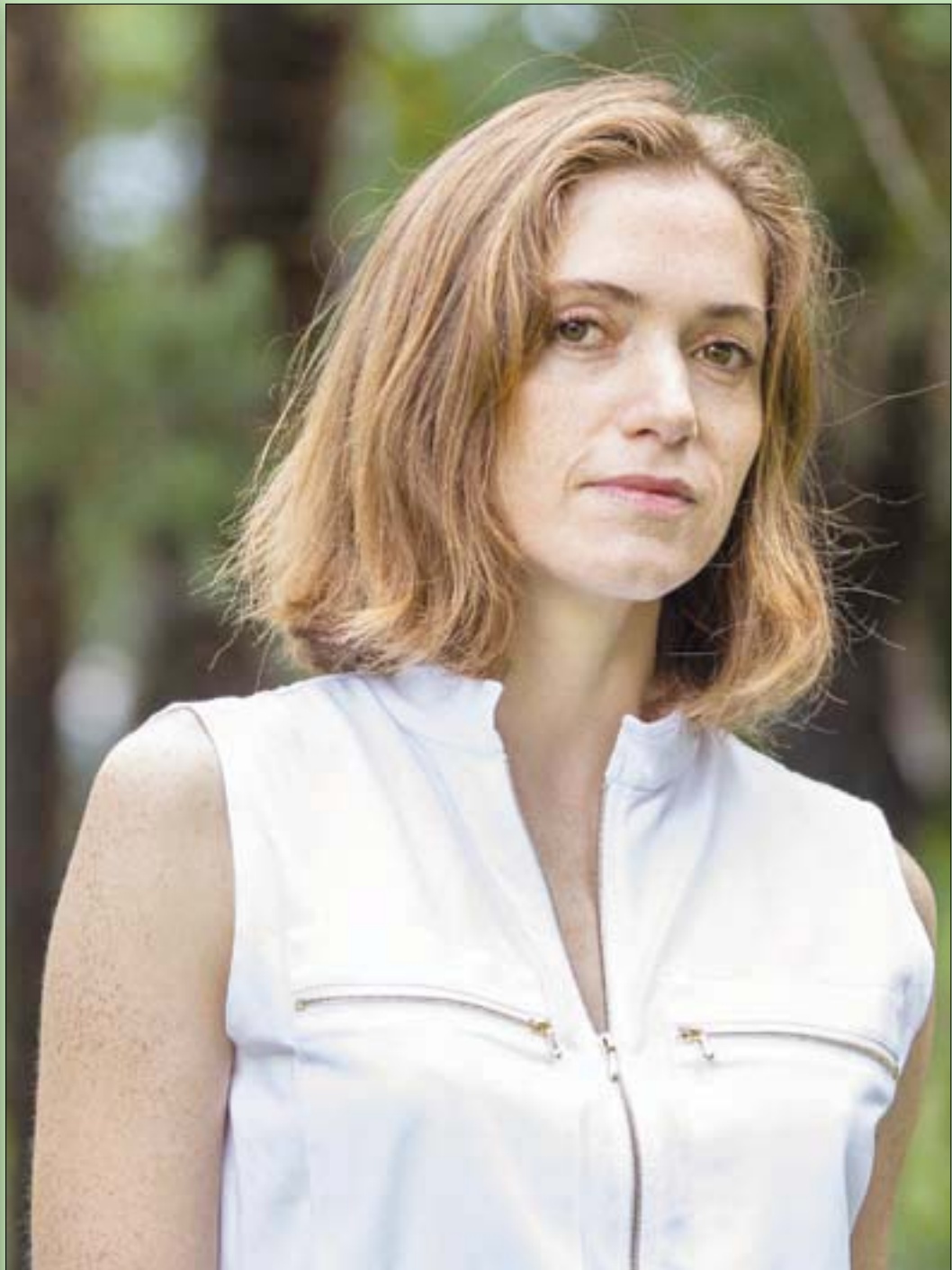
المثلة الفرنسية مود ويلر أثناء التقاط صورة لها في «مهرجان لوكارنو السينمائي الدولي» الرابع والسبعين بسويسرا

الحقيقة أن قرار الانسحاب من أفغانستان اتخذ دونالد ترمب لا جو بايدن، عندما أعلن أنه «لا يمكن لأولادنا الاستمرار في القتال من أجل الآخرين». لقد خس الأميركيون في حروب السنوات العشرين، بما فيها أفغانستان، نحو 10 آلاف قتيل بينما خسروا في الفيتنام 57 ألفاً. لقد تعلموا شراء «لوردات الحرب» بدل أن يقاتلوا بانفسهم. والآن هم ينسحبون، تاركين الأفغان لمرحلة أخرى من الفوضى والرعب. هذه حروب بلا نهاية وبلا رحمة وبلا إطار محدود أو محدد. الوف الناس ينزحون من مكان إلى آخر. وهذا ليس «قرن أميركا» بل قرن النازحين في أنحاء العالم: يورما والصين وسوريا والأردن ولبنان. والدول تنهار أمام الدولة الناقضة، أو الميليشيات، أو من تلقاء نفسها كما يحدث في لبنان. لن تتوقف «طالبان». وكل ما علينا فعله هو عد المدن المتساقطة. وعلينا أن نستذكر من جديد الأسماء التي ملأت أذهان العالم لكي نعرف موقعها في خريطة السقوط والتحول: قندهار، قندوز هرات كابول. وهلم جرا. وسوف يقف العالم أمام مأساة بشرية أخرى، لن يتردد في استنكارها وفي الدعوة إلى الهدوء. عودنا التاريخ أنه عندما يكرر نفسه في أفغانستان، لا يخرج عن تقليده. عندما دخل الأميركيون كابول قبل عشرين عاماً، كان يتقدمهم كبير مراسلي «البي بي سي» جون تومسون، ليغطي العملية بنسيء من الفرح. وكنت أقول في نفسي ما الذي يفرح هذا المرسل الخبير، ولماذا يضحك؟ فلنتوقع خيراً جديداً كل يوم. ولاية أخرى، عاصمة إقليمية أخرى. الجميع نازلون من الجبال. وسوف يعبرون ممر خيبر.