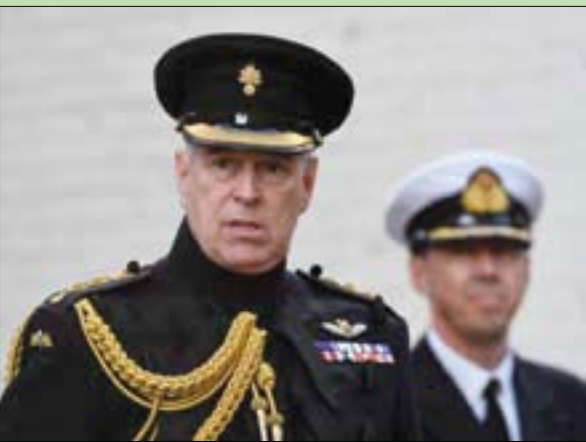
الأمير البريطاني أندرو دوق يورك

وزُفعت الدعوى أمام محكمة مانهاتن الفيدرالية الاثنين بموجب قانون في ولاية نيويورك لحماية الضحايا القصر بمنح مهلة سنة واحدة لتقديم شكوى في قضايا الاعتداء الجنسي من دون أن يشملها مبدأ التقادم. هذا القانون الذي دخل حيز التنفيذ في أغسطس (آب) 2019، يترك بضعة أيام لضحايا المحتملين للتحرك.