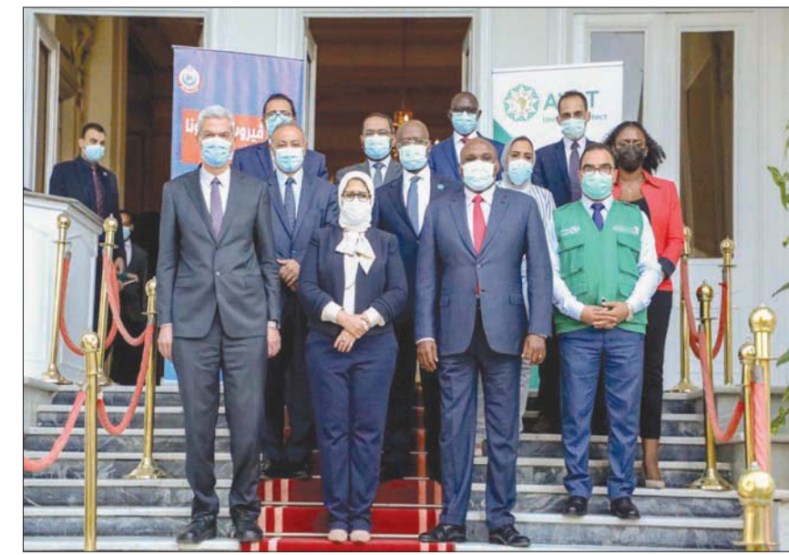
وزيرة الصحة المصرية مع وفد البنك الأفريقي في القاهرة أمس

للصادرات والواردات، إشادته بالدور الكبير لـ«AVAT»، مؤكداً أن تلك المرة الأولى من نوعها التي تسخر فيها الدول الأفريقية جميع مواردها لتوفير اللقاح والسطح القائمة على إدارة الجائحة والحفاظ على صحة المواطنين بالقارة، معرباً عن سعادته بمشاركة البنك في هذا الحدث ووصول جرعات اللقاحات للدول الأعضاء بالاتحاد الأفريقي، ومنها مصر، حيث من المتوقع زيادة وصول شحنات اللقاح في شهر سبتمبر (أيلول) المقبل. «ماربورغ، غينيا» كانت منظمة الصحة العالمية أعلنت الاثنين أن غينيا أكدت تسجيل إصابة بفيروس «ساربروغ» هي الأولى في غرب أفريقيا للمرض المميت الذي ينتمي إلى عائلة فيروس «إيبولا» ومثل «كوفيد - 19» انتقل من الحيوانات إلى البشر. وقالت المنظمة إن الفيروس الذي نقله الخفافيش، والذي يصل معدل الوفيات الناتجة عنه إلى 88 في المائة، تم اكتشافه في عينات مأخوذة من مريض فارق الحياة