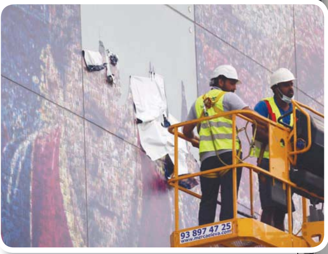
العمال يزبلون صورة ميسي من ملعب «كامب نو» مغلل برشلونة