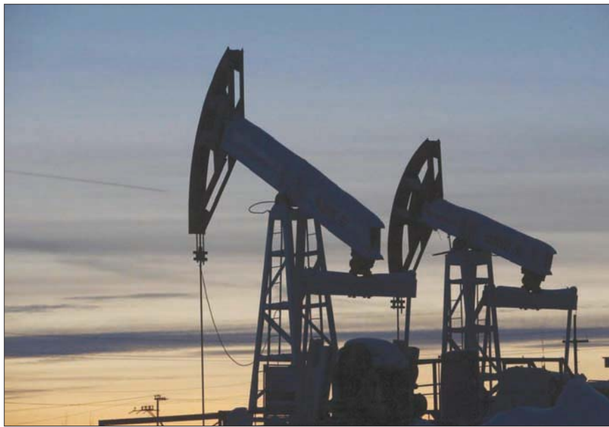
عوامل متباينة تؤثر على اتجاه أسعار النفط