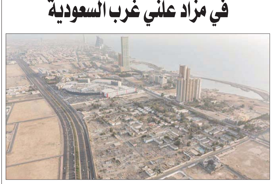
يقع مشروع «أرغوان» في شمال مدينة جدة السعودية