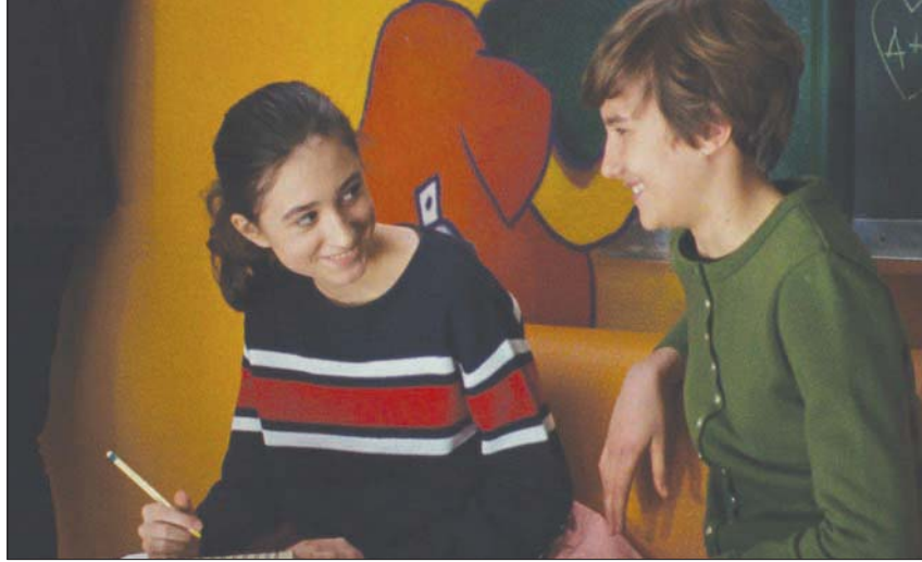
من الفيلم الفرنسي «سولانج الصغيرة»