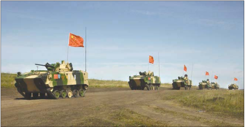
انتقال الطرفين إلى التدريب على التكامل المباشر للقوات البرية والتعامل مع الطرازات المختلفة للأسلحة

كان الصينيون يضمنون إلى مناورات تجري في روسيا، بينما هنا نحن نتحدث عن مهام أكثر طموحاً (...). تستعد جمهورية الصين الشعبية والاتحاد الروسي لاحتمال مواجهة عمل عسكري ضدهما». وفي إشارة إلى أنه لا يوجد اتفاق عسكري بين موسكو وبكين حالياً، قال الخبير: «اعتقد أن هدف الدولتين هو الحفاظ على حالة عدم اليقين هذه، مع توجيه رسالة لواشنطن أن هناك احتمالاً لإبرام مثل هذا الاتفاق». اللافت أن هذه التدريبات، تجري مباشرة بعد انتهاء تدريبات عسكرية واسعة أجرتها القوات الروسية قرب الحدود الأفغانية مع قوات أوزبكيا وطاجيكية، كما تستعد موسكو لإجراء مناورات أخرى الشهر الحالي يشارك فيها الجنود الصينيون والروس جنباً إلى جنب مع جنود من بيلاروسيا وإسرائيل ومنغوليا وروسيا وطاجيكستان وأوزبكستان، لتلعبها مناورات لقوات البلدان المنضوية في إطار منظمة شنغهاي للتعاون. وفي الشهر المقبل ينتظر أن تجري روسيا مناورات عسكرية ضخمة مع الجيش البيلاروسي على مقربة من الحدود مع أوروبا.