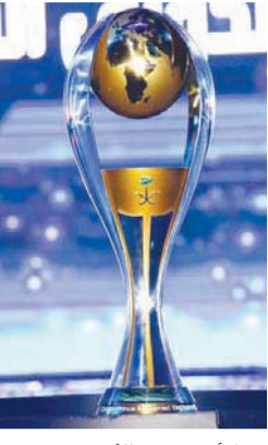
كأس دوري الأمير محمد بن سلمان (الشرق الأوسط)

وتتواصل منافسات الجولة الأولى على مدى 4 أيام، حيث تقام يوم الخميس 3 مواجهات، تجمع الأولى بين أبها وضيعة الشباب، فيما يستقبل الرائد نظيره الفتح، ويواجه الحزم الذي حقق عودة سريعة نحو دوري المحترفين السعودي نظيره فريق التعاون في مدينة الرس. ويظهر فريق النصر مساء يوم الجمعة، حينما يتضيف نظيره فريق ضمك