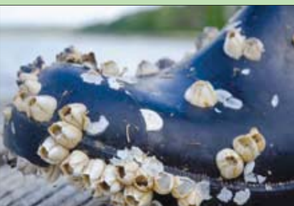
تشريبات البرنقيل تلتصق بالصخور والسفن والحيوانات

ويقول هيونو يوك، الباحث الرئيسي بالدراسة في تقرير نشره المعهد الإلكتروني لمعهد ماساتشوستس بالتزامن مع نشر الدراسة «عندما يُوضع الغراء الناتج على سطح مبلل مثل الأنسجة المغطاة بالدم، فإن الزيت يصد الدم والمواد الأخرى التي قد تكون موجودة؛ مما يسمح للجسيمات الدقيقة اللاصقة بالتشابك وتشكيل ختم محكم على الجرح، واطهرنا في الاختبارات التي أجريت على الفئران نجحنا في سد الجروح خلال 15 إلى 30 ثانية من وضع الغراء».