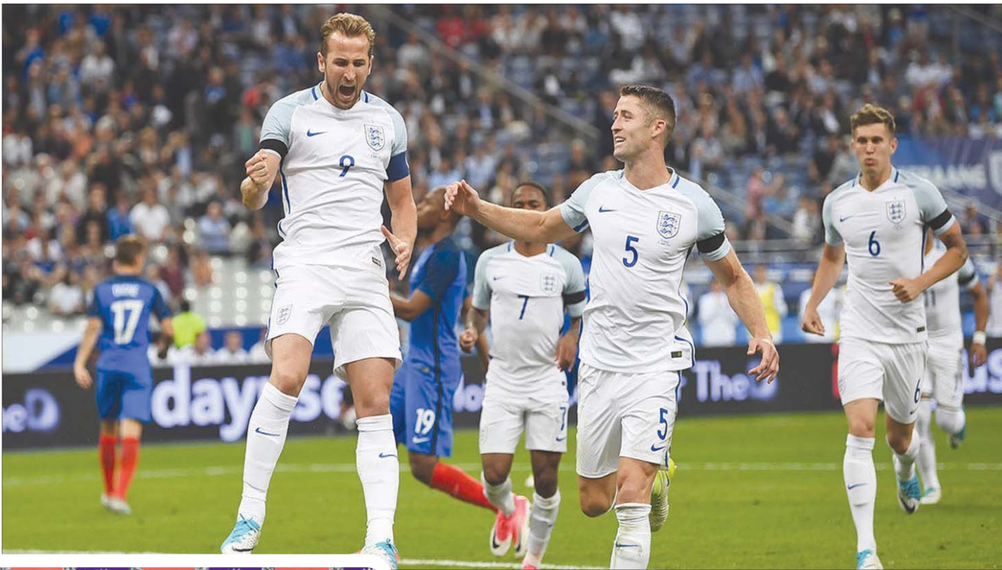
كين تعرض لكثير من الانتقادات، لكن من حق أن يتهم النادي بالتقاعس خلال العامين الماضيين