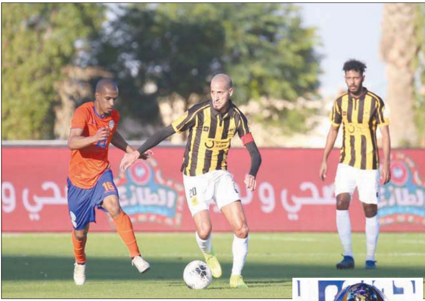
الاتحاد والفيحاء يقصان شريط المنافسات للنسخة الجديدة من الدوري السعودي الليلة

الأهلي صفوفه باللاعب البرازيلي باوليبيو صاحب التجربة الثرية في كتيبه من الفرق، أبرزها برشلونة الإسباني، بالإضافة لتعاقد النادي مع اللاعب المقدوني اليوسكي القادم من صفوف فريق ليدز يونائيد الإنجليزي، والسنگالي الحسن نداو، والمدافع البرازيلي داتكليف بيريرا، والكرواتي فيليب براداريتش.