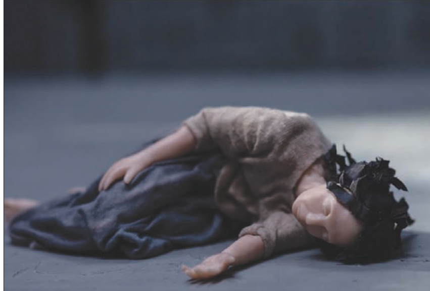
من فيلم الأنيميمن الفلسطيني «ليل»

تعتبر المنتجة التي احتفت بها عدة مؤسسات ومهرجانات خلال السنوات العشرين السابقة أن السينما المستقلة لها مشاكلها في المكاتب قبل مشاكلها كأعمال منتجة، لكن هذا ما يمكن قوله على مختلف أصعدة الفيلم مستقلاً أو غير مستقل. توافق على ذلك وتضيف: «ركزت خلال الندوة على هذه المشاكل لأنها تنتشر في أرجاء العالم وحتى تكون السينما المستقلة سينما ناجحة عليها أن تتمتع بالسولوك