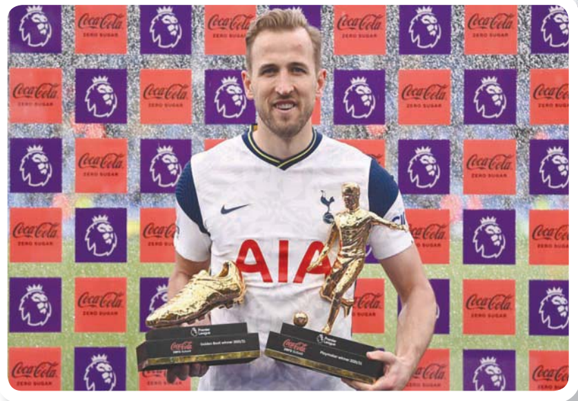
لماذا يرغب مانشستر سيتي في ضم هاري كين؟ (الشرق الأوسط)

هذا لا يعني أن كين سيكون بالضرورة محقاً في طلب الرحيل، لكن الحقيقة هي أن توتنهام هو الذي أوصل اللاعب إلى هذا الموقف بسبب عدم إبرام صفقات جيدة لتدعيم صفوف الفريق. كما أنه من الواضح أن رفض ليفي للبيع وأسلوبه التفاوضي الصعب سيجعلان الوضع أكثر صعوبة. وعلاوة على ذلك، فإن بيع لاعب مميز لا يكون سلبياً دائماً، والدليل على ذلك أنه خلال الخمسين عاماً الماضية نجحت