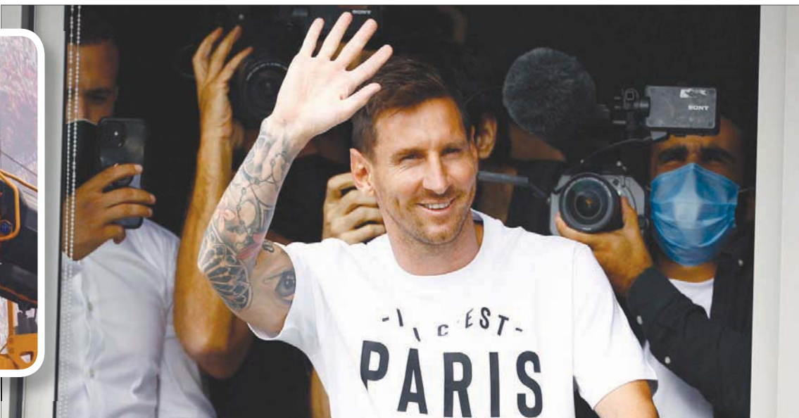
ميسي مرتدياً قميصاً كتب عليه «هنا باريس» يحيي جماهير سان جيرمان

وكان نيمار من أول المرشحين بالنجم الأرجنتيني، بمنشور على «إنستغرام» في كتاب فيه: «اهتمتنا مجدداً» في إشارة إلى الفترة التي أمضاها اللاعب معاً في النادي الكاتالوني بين 2013 و2017، قبل أن ينتقل البرازيلي إلى نادي العاصمة الفرنسية، في صفقة قياسية بلغت 222 مليون يورو.