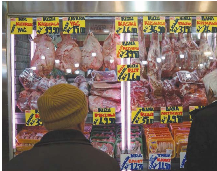
قفزت تركيا إلى المرتبة الأولى في مؤشر البؤس الاقتصادي العالمي مع سيطرة الغموض

في الوقت ذاته، سجلت تركيا عجزاً قياسياً في ميزانيتها خلال شهر يوليو الماضي، بلغ 67,9 مليار ليرة. وحسب بيانات صادرة عن وزارة الخزانة والمالية التركية، أمس، بعد هذا هو أعلى عجز تسجله الميزانية على أساس شهري، بينما سجل العجز في الشهر ذاته من العام الماضي