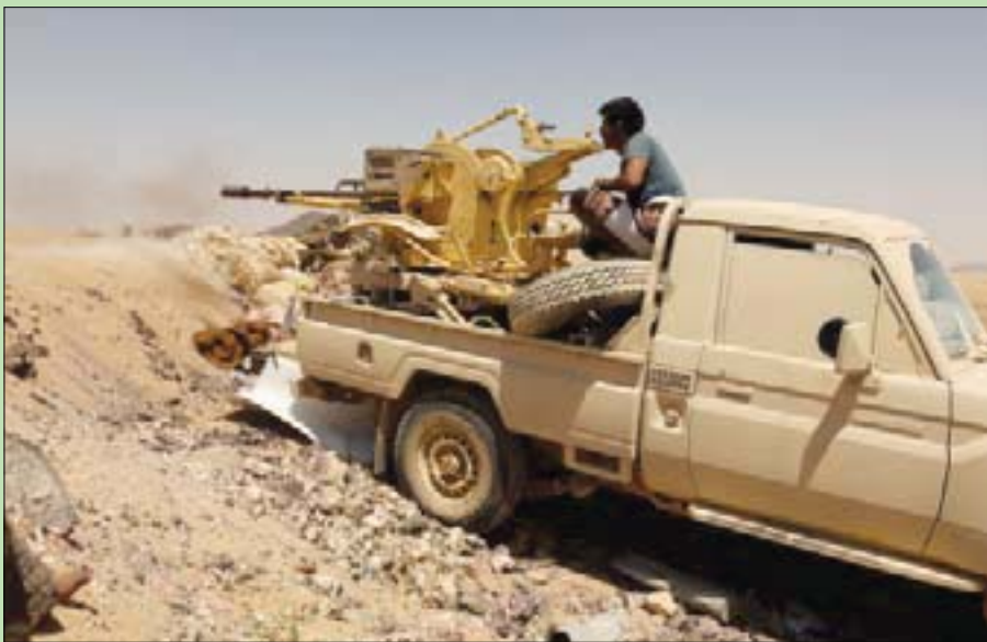
مقاتل موال للقوات الحكومية على إحدى جبهات مارب لمواجهة الحوثيين (رويترز)

بأنها «محاولة لتجزئة الحلول العسكرية، وليس السياسية، بهدف إسقاط كل المحافظات بهذه الطريقة، من خلال إبرام اتفاقيات إدارة مشتركة».