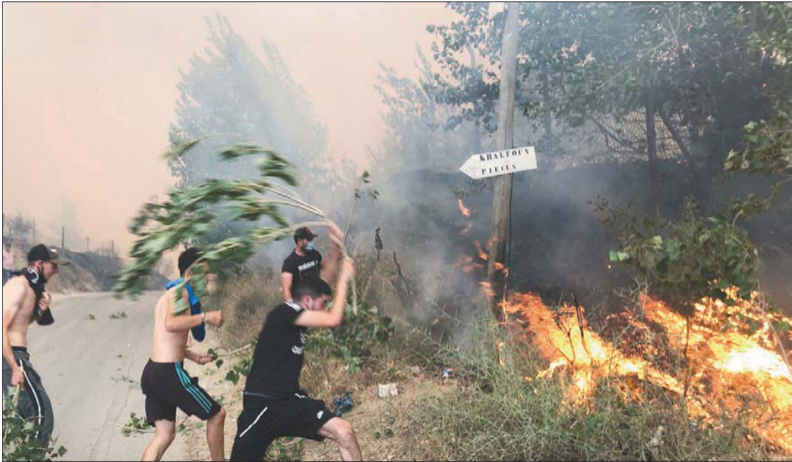
حرائق تشتعل في منطقة القبائل شرق العاصمة خلّفت 7 قتلى

يستحيل أن تكون أسباب هذه الحرائق طبيعية». وجاء في بيان لهيئة الدفاع المدني، أن 36 حريقاً شبّ في الغطاء النباتي بـ18 محافظة (58 محافظة في البلاد)، ليل الإثنين إلى الثلاثاء، 19 منها اندلع في تيزي وزو المعروفة بكثافة غاباتها بجبال جرجرة. وأبرز البيان أن رجال الدفاع المدني تمكنوا من إخماد 12 حريقاً في تيزي وزو، و«عدة حرائق أخرى، في محافظات البويرة وبوعروريج وسكندة وبومرداس، ومقابلة وخنشلة وتبسة، وهي مناطق تقع كلها في شرق البلاد.