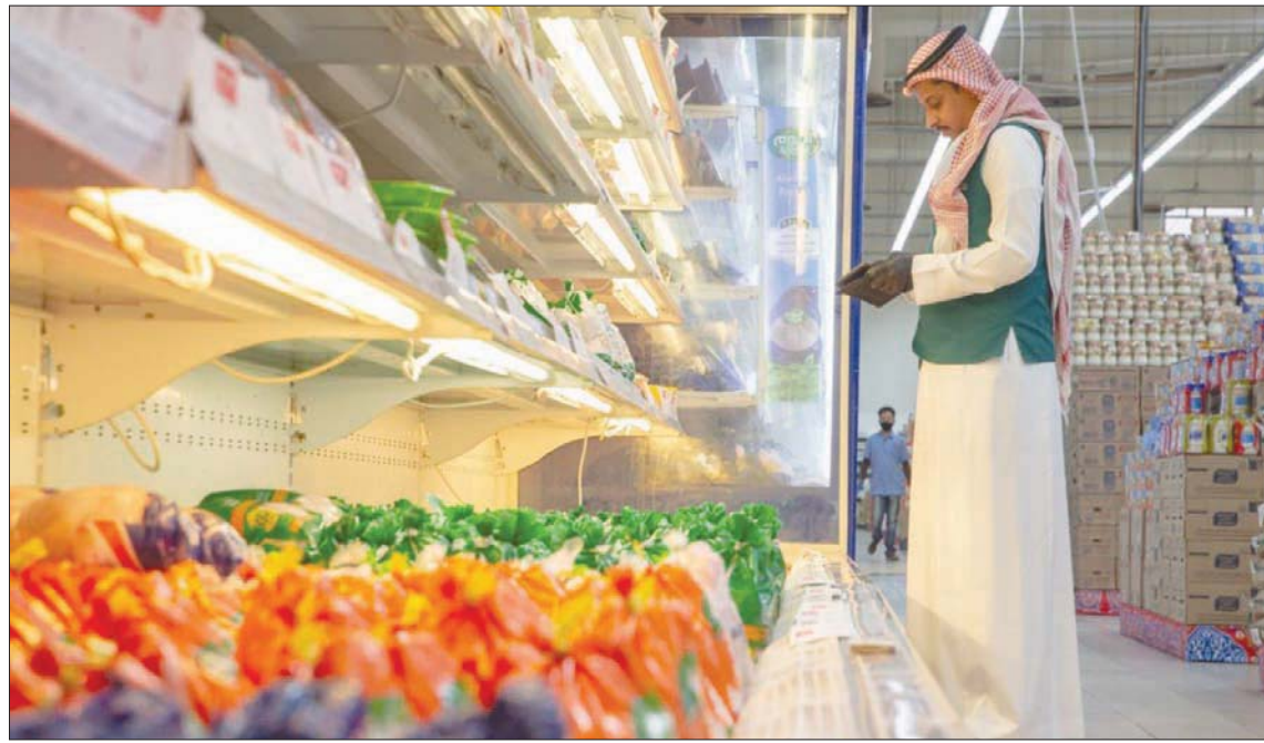
توجه سعودي لمنع مرتكبي العش التجاري من السفر لضبط سوق السلع والمنتجات (الشرق الأوسط)

وتحرير محضر بذلك، علاوة على ضبط إفادة المخالفين ودخول وتفتيش المنشآت وأماكن التخزين ووسائل النقل للتحقيق من وجود المخالفة ومصادرة وإتلاف المنتج، كما لدى المأمورين صلاحية إغلاق المحلات لحين تمكينهم من دخولها والاستعانة بالجهة الأمنية المختصة عند الاقتضاء. ويعاقب مخالفو نظام مكافحة العش التجاري بغرامة مالية تصل إلى مليون ريال (266 ألف دولار) أو السجن مدة تصل إلى 3 أعوام أو بهما معاً، ومصادرة المنتج والأدوات التي تم استخدامها في العش وإتلاف السلع المغشوشة، إضافة إلى التشهير بالمخالف مع التشهير بالمخالفين وإبعاد العمالة المخالفة. وتجدر الإشارة إلى أن النظام الجديد يهدف إلى حماية حقوق المستهلكين وتطبيق العقوبات النظامية على المنشآت المخالفة لنظام مكافحة العش التجاري، حيث ينص النظام على فرض عقوبات تصل إلى السجن 3 سنوات وغرامات مالية تصل إلى مليون ريال أو بهما معاً، مع التشهير بالمخالفين وإبعاد العمالة المخالفة. والتتمة وزارة عموم المستهلكين على التقدم بلاغاتهم عن المنشآت المخالفة عبر تطبيق «بلاغ تجاري» أو عن طريق مركز البلاغات على الرقم 1900 أو الموقع الرسمي للوزارة على الإنترنت.