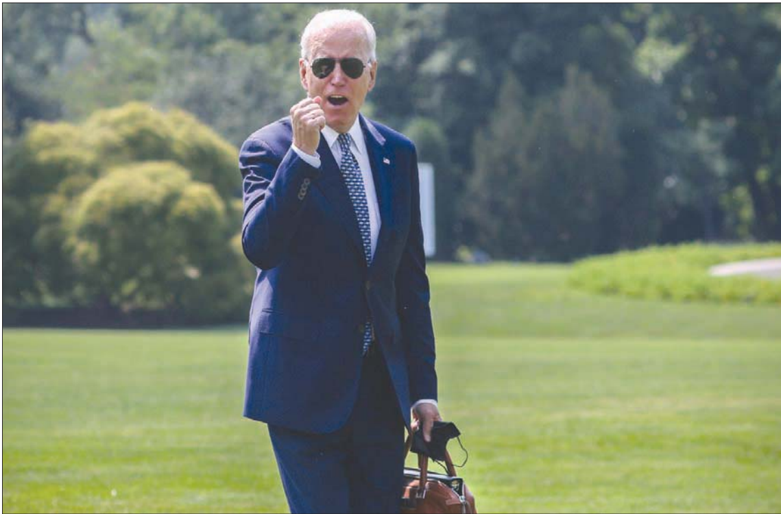
المشروع التاريخي الذي وصلت قيمته إلى نحو تريليون دولار حقق نصراً كبيراً للرئيس جو بايدن

بسبب المشروع، وذكر هؤلاء أرقام مكتب الموازنة التابع للكونغرس والذي قدر العجز جراء المشروع في الأعوام الـ10 المقبلة بـ256 مليار دولار.