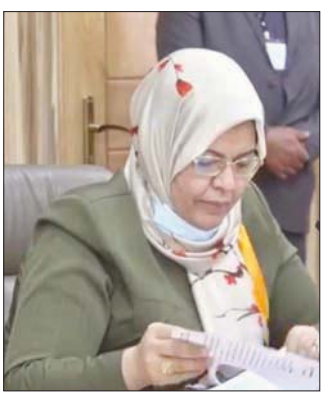
وزيرة العدل الليبية حليلة عبد الرحمن

قادرة على التصدي والتعامل مع العناصر الإرهابية، ويعد احتمال التحقيق يتم عرض أمر هذه العناصر على لجنة الإبعاد والترحيل بوزارة قصير ولكننا نحاول وضع أسس سليمة يمكن البناء عليها مستقبلاً». وأضافت قائلة: «هناك سجون كانت