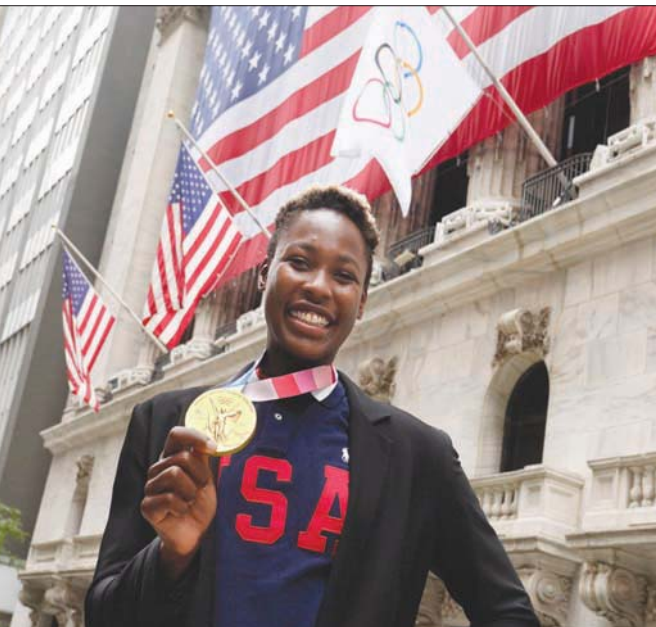
بطلة مسابقات الودوت بولو الأميركية أشلي جونسون تحفل في وول ستريت

نيويورك خلال ربع سنة لكن تحركاً قامت الهيئات التنظيمية في الصين أضرّ بالتقييمات في وقت لاحق، وبرز المخاطر الصينية بالنسبة إلى «سوفت بنك» في الوقت الذي تسعى فيه المجموعة لخفض اعتمادها على أكبر أصل تملكه، وهي حصة في علاقات التجارة الإلكترونية مجموعة «علي بابا القابضة». وتعرّض «سوفت بنك» الاستثمار عبر صندوق «رؤية» الثاني، الذي تعهدت بما قيمته 40 مليار دولار من رأس ماله، فيما نُفِذت الوحدة 47 استثماراً جديداً بقيمة 14,2 مليار دولار في ربع السنة بين أبريل (نيسان) ويونيو (حزيران) وحده. وفي الربع الأول، شملت مكاسب صندوق «رؤية» 310 مليارات ين من بيع أسهم في استثمارات من بينها شركة «دور داش» و«أوبر تكنولوجيز». لكن صافي ربح الربع الأول انخفض 39% إلى 762 مليار ين.