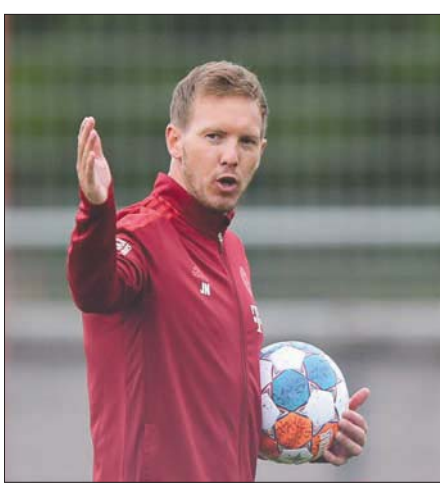
الانتظار على ناغلسمان مدرب بايرن الجديد

وستكون الأنتظار على المدرب جوليان ناغلسمان، المنتقل من لايبزغ إلى بايرن ميونخ حامل اللقب ليخلف هاتزي فليك الذي