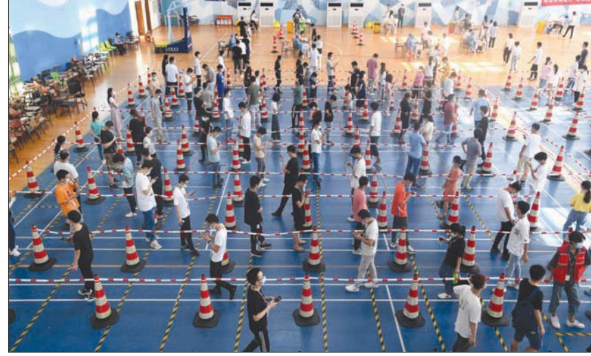
موظفو شركة في ووهان يصطفون من أجل فحص كورونا قبل أيام

وتبين أن مصدر عشرات الحالات مركز فحوصات للكشف عن كوفيد في مدينة يانغتشو (شرق). وفي دليل على القلق الناجم