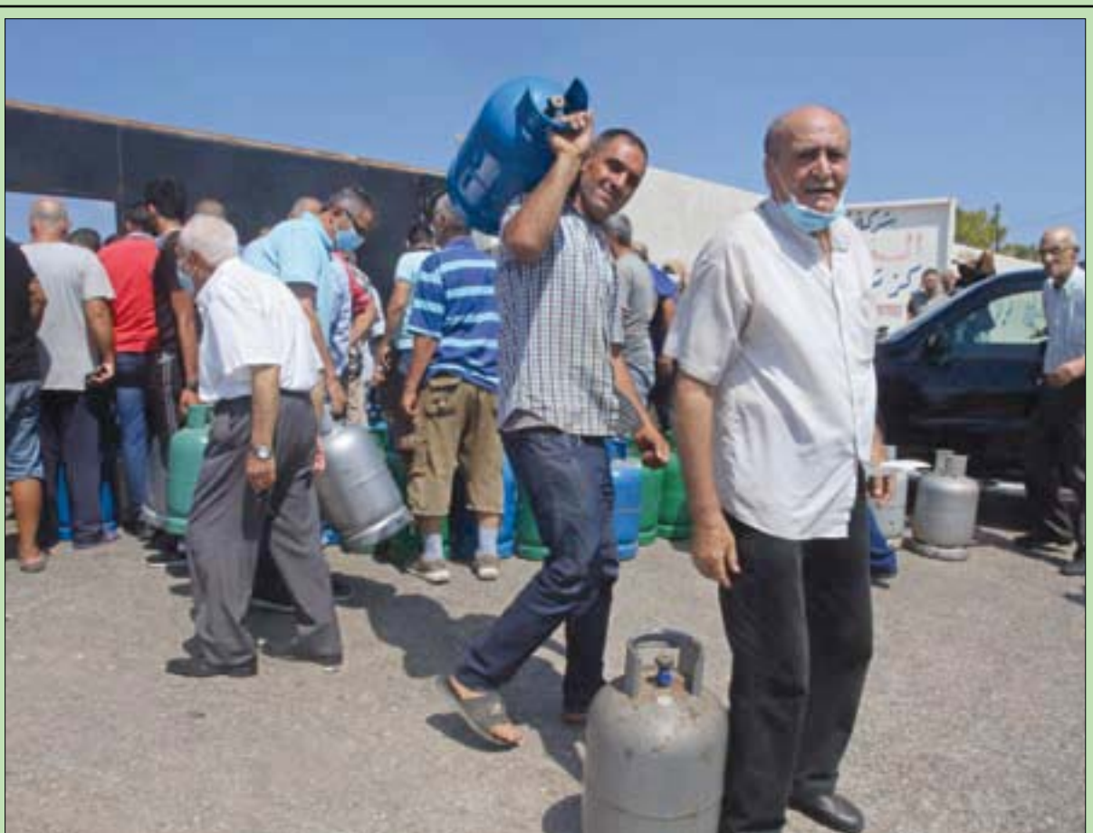
لبنانيون ينتظرون الحصول على الغاز في محطة وقود بصيدا أمس