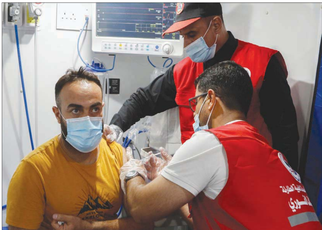
عراقي يتلقى جرعة لقاح في بغداد أمس

بغداد، «الشرق الأوسط» اقترب إجمالي الوفيات بفيروس كورونا في العراق إلى 20 ألفاً؛ إذ أفادت وزارة الصحة والبيئة في العراق، أمس (الثلاثاء)، بتسجيل 66 حالة وفاة جديدة بفيروس كورونا خلال الساعات الأربع والعشرين الماضية. ويرتفع بذلك إجمالي الوفيات جراء الوباء في العراق إلى 19 ألفاً و336 حالة، طبقاً لوكالة الأنباء الألمانية. وقالت الوزارة في تقرير أمس، إنه تم تسجيل 9970 إصابة بالفيروس، ليرتفع إجمالي الإصابات إلى مليون و732 ألفاً و298 إصابة. وأشار التقرير إلى شفاء 9926 شخصاً، ليرتفع إجمالي المتعافين إلى مليون و547 ألفاً و666. ولفت التقرير إلى أن المستشفيات أجرت خلال الساعات الماضية 42 ألفاً و401 فحص مخبري لمواطنين للتحقق من الإصابة بفيروس كورونا. وارتفع بذلك عدد الذين خضعوا للفحص المخبري إلى 13 مليوناً و545 ألفاً و244. وأوضح التقرير، أن إجمالي الذين تم تطعيمهم باللقاح المضاد لفيروس كورونا وصل إلى مليونين و263 ألفاً و353 شخصاً. إلى ذلك، استمقت السلطات الصحية في العراق طقوس يوم عاشوراء بتنظيم حملة تطعيم ضد مرض «كوفيد - 19» في مدينة كربلاء المقدسة لدى الشيعة، بحسب «رويترز».