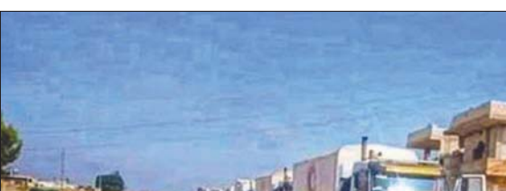
صورة أرشيفية لقافلة مساعدات في درعا

وقالت مصادر محلية في درعا إن أحياء درعا البلد والمناطق المحيطة بها لا تزال تتعرض للقصف والاستهداف بالمضادات الأخرية، وتزامن عمليات القصف مع محاولات تقدم واقتحام تنفيذها قوات الفرقة الرابعة ليلة الثلاثاء عند «الكازية» في حي المنشية، كما جرت اشتباكات على محور حي «طريق السد» شرق مدينة درعا، مع وقوع إصابات وقتلى لعناصر محلية تابعة لجهاز الأمن