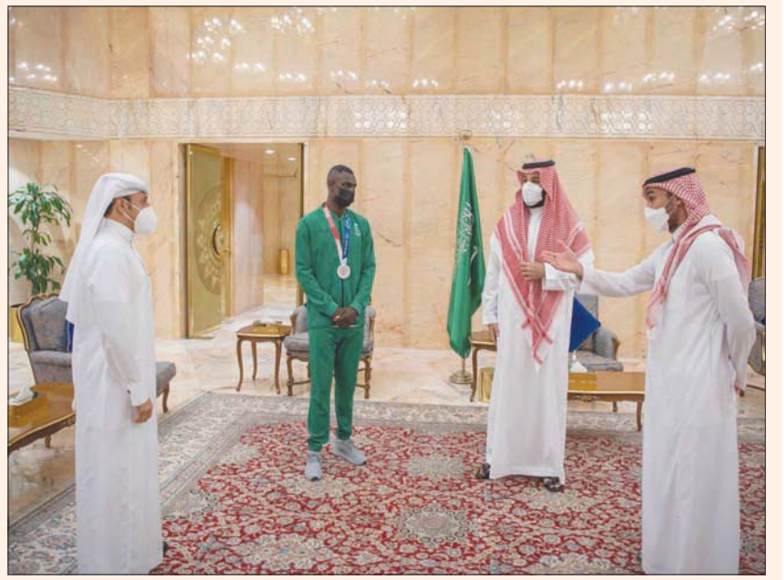
ولي العهد مستقبلاً حامدي في حضور الفيصل أمس

وتتواصل منافسات النسخة الحالية بمواجهة وحيدة هذا المساء، تجمع بين الاتحاد ومُضيفه فريق الفيحاء الذي عاد مجدداً لمنافسات دوري المحترفين السعودي، بعد موسم وحيد من هبوطه نحو مصاف