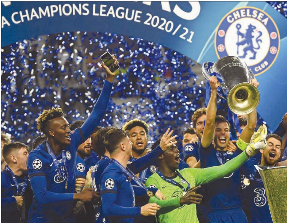
لاعب تشيلسي أبطال أوروبا يتطلعون لبداية قوية للموسم من بوابة كأس السوبر

مقابل صفقة قياسية في تاريخ النادي تقدر بـ 97 مليون جنيه إسترليني (135 مليون دولار). وكان رجال المدرب توخيل فازوا على مانشستر سيتي في مايو (أيار)