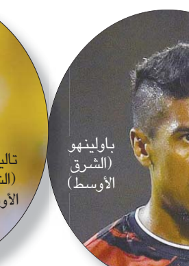
باوليبيو (الشرق الأوسط)

قادمًا من بوافيسستا البرتغالي، فيما ضم نادي الحزم المدافع هيوجلو نيريس بنظام