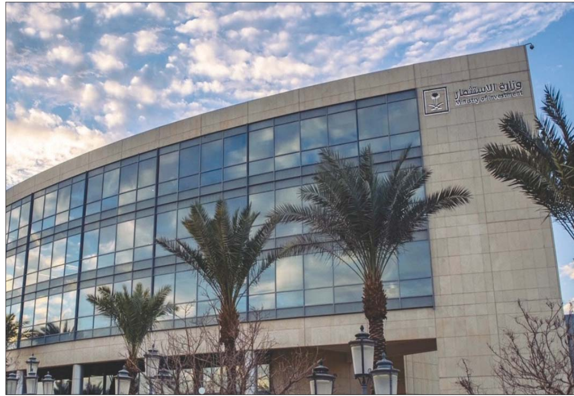
السعودية تواصل تهيئة بيئة استقطاب الاستثمارات الأجنبية (الشرق الأوسط)

وتعكس الأرقام الصادرة عن التقرير استمرار الزخم باتجاه التنوع الاقتصادي للمملكة، إضافة إلى سرعة تكيف الاقتصاد مع المتغيرات التي فرضتها الجائحة العالمية على الأسواق العالمية وعلى التوجهات الاستهلاكية. وبين التقرير أن الاستثمارات الأجنبية المباشرة بحسب بيانات البنك المركزي السعودي، وصلت لأعلى مستوياتها خلال 5 سنوات حيث وصل إجمالي تدفقات الاستثمار الأجنبي المباشر في المملكة إلى 5,5 مليار دولار في عام 2020. وأشار التقرير إلى الارتفاع الكبير في الاستثمارات الأجنبية غير المنفصلة بنسبة 198 في المائة في الربع الأول من هذا العام، حيث أظهرت البيانات أن الاستثمارات الصناعية الحاصلة على ترخيص وزارة الصناعة والثروة المعدنية سجلت قفزة كبيرة خلال مارس (آذار) لتبلغ 4,1 مليار دولار. وأبان التقرير استمرار