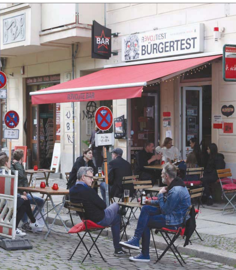
تدهورت معنويات المستثمرين في ألمانيا على خلفية مخاوف من تضرر التعافي الاقتصادي

رابعة محتملة من (كوفيد - 19) تبدأ في الخريف أو تباطؤ في النمو بالصين». وأرتفع مقياس منفصل للأوضاع الراهنة إلى 29,3 نقطة من 21,9 في يوليو (تموز) الماضي، خلفية مخاوف من تعثر التعافي في أكبر اقتصاد في أوروبا بفعل زيادة الإصابات بـ«كوفيد - 19» وموجة رابعة من الإصابات بفيروس «كورونا».