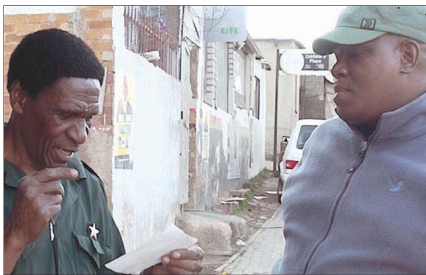
مشهد من فيلم «سير مع الملائكة»

المخرجة تستخدم الممثلة الصغيرة لترجمة ما تعابته الشخصية من قلق ومخاوف. ما الذي سيحدث إذا تصدع البيت ثم تداعي. هناك معانئاتان في الفيلم. معاناة الفتاة سولانج ومعاناة المشاهد (أيما كان اسمه). الثانية ستبقى لحين كتابة هذا النقد بعد يومين من مشاهدته. المشكلة هي أن الفيلم قديم وإن انتمى إلى إنتاج هذه السنة. قديم المشكلة قديم في وجهة النظر التي تعرض المشكلة وقديم في المعالجة الوضعية وغير الطموحة. زيادة في الاحتفاء بميرات الميلودراما، تقوم المخرجة باختيار مشاهد لا تضيف بل تستمر ويصاحب اللحن الموسيقي الملمع بالمقاطع المثيرة للضحك من البداية وفي كل الزيارات التي يقوم بها لاحقاً. كل هذا يخلق عملاً لا يمكن له أن يخلق علاقة عاطفية (من باب التعاطف) مع الوضع أو مع الشخصية التي قصد بها أن تتحمل وزر أخطاء الكبار.