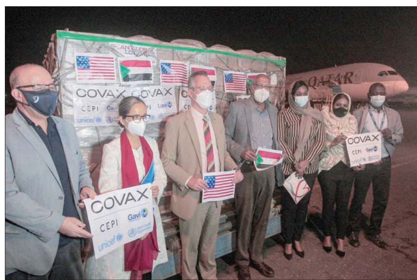
وزير الصحة السوداني يشارك في استقبال الوفد الأميركي مساء أول من أمس

انتشار الجائحة في ولاية البحر الأحمر، ويساعد أهلنا هناك خاصة أنه يعطى كجرعة واحدة فقط». وشدد المسؤول الأول عن الصحة في السودان، على أهمية التزام الاحترازمات الصحية، وذلك بارتداء الكمامات والحفاظ على