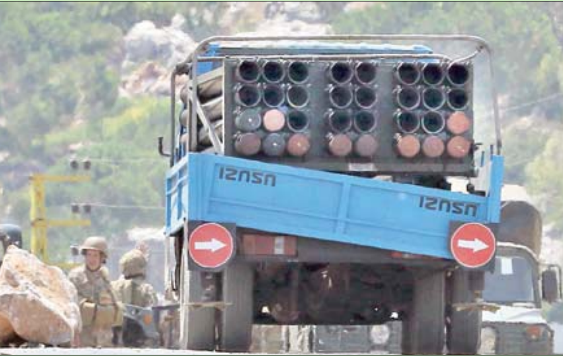
جنود لبنانيون يقفون قرب شاحنة محملة بقاذفات صواريخ صادرها الجيش في قرية شويبا الدرزية جنوب لبنان أمس