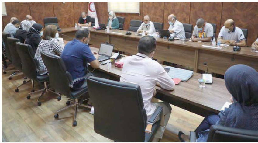
اجتماع اللجنة التسييرية بطرابلس للتفويض ضد كورونا أول من أمس (المركز الوطني لمكافحة الأمراض)

نظراً لانتشار جائحة «كورونا» ليمع على التجار عرض بضائعهم لبعض في الطرق والأسواق إلى حين إشعار آخر، وهي السوق التي تُعقد يوم الجمعة من كل أسبوع. وفيما شددت البلدية على ضرورة الأخذ بالاحترازمات الوقائية المتبعة لمحاصرة الجائحة، وجهت المواطنين لضرورة أخذ اللقاح. وسجلت ليبيا منذ ظهور الجائحة نحو 264 ألف إصابة بالفيروس في عموم البلاد، تعافى منهم 196 ألف حالة، بينما توفي 3663 مصاباً. ووجه مستشفى غريان المركزي التعليمي نداء استغاثة عاجل لوزارة الصحة والجهات المختصة بضرورة التدخل لوضع حل لمشكلة «القص الحاد» في مادة الأكسجين،