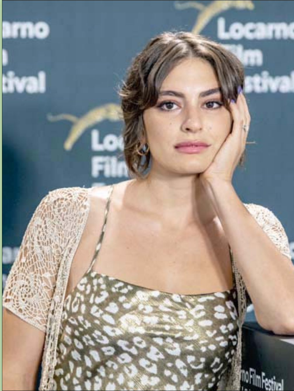
المثلة اللبنانية يمني مروان حضرت عرض فيلمها «النهر» في مهرجان «لوكارنو» في سويسرا

وما أن قرأت ذلك حتى أغمضت عيني مستعرضاً أصدقائي من الرجال، فوجدت الأغلبية هم من أصحاب الكروش، والبقية الباقية هم: (صوير وعوير واللي ما فيه خير)، وأنا من ضمنهم - والاعتراف بالحق فضيلة.