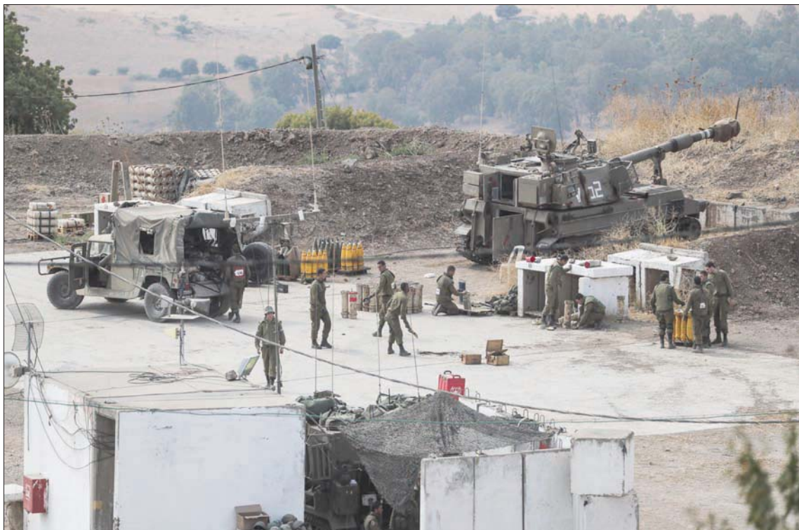
جنود إسرائيليون قرب مريض لمدهم التي قصفت مواقع في لبنان أمس

الحدودية تصبح جبهة نشطة" مشيراً إلى أن "الهجمات الصاروخية كانت محاولة من قبل حزب الله لإظهار سيطرته على جنوب لبنان بعد إطلاق الصواريخ يوم الأربعاء التي نسبت إلى الفصائل الفلسطينية". وأكد كوخافي أن "حزب الله اختار عمداً استهداف المناطق المفتوحة وليس التجمعات السكانية". وأصدر "حزب الله" بياناً قال فيه إن قصفه جاء رداً على القصف الإسرائيلي، وشدد على أن القصف استهدف مناطق مفتوحة. وقال نائب رئيس الحزب، نعيم قاسم، إن الحزب لم يبادر إلى القصف بل منظمة فلسطينية هي التي فعلت وإن قواته قصفت إسرائيل رداً على الرد. وأعلن الحزب أنه لن يبادر إلى قصف الفلسطينيين من طرفه عن اعتقال أربعة فلسطينيين يشتبه أنهم نفذوا القصف الصاروخي على إسرائيل والقانون.