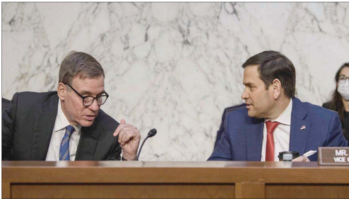
قدم نائب رئيس لجنة الاستخبارات في مجلس الشيوخ السيناتور الجمهوري ماركو روبيو (يسار) تشريعات تقرض عقوبات على الدول «الرابعة لبرامج الفدية»

الجرام الإلكترونية. وقدم نائب رئيس لجنة الاستخبارات في مجلس الشيوخ السيناتور الجمهوري ماركو روبيو، والسيناتور الديمقراطي ديان فاينستين، أول من أسس الخميس، تشريعات، تقرض عقوبات على الدول التي يعتبرها وزير الخارجية ومدير المخابرات الوطنية «رابعة لبرامج الفدية». من خلال إيواء أو تقديم الدعم لمجرمي الإنترنت الذين ينفذون مثل هذه الهجمات، وسيطلب من الرئيس بعد ذلك فرض عقوبات تتفق مع تلك المفروضة على الدول التي تعد «رابعة لارهاب». ويقود التشريع في مجلس النواب النائبة الديمقراطية إبيغيل سيناتيرو، والنائب الجمهوري بليك تم، وآخرين من الحزبين، حيث تم تقديم مشروع القانون في وقت واحد إلى مجلس الشيوخ من قبل السيناتور الديمقراطي بريان شاتنر، والسيناتور الجمهوري توم تيليس. وقال روبيو في بيان: «هجمات برامج الفدية تهدد صحة وسلامة عدد لا يحصى من الأميركيين، ويوفر مشروع القانون الخاص بنا من الحزبين الأدوات اللازمة للمساعدة