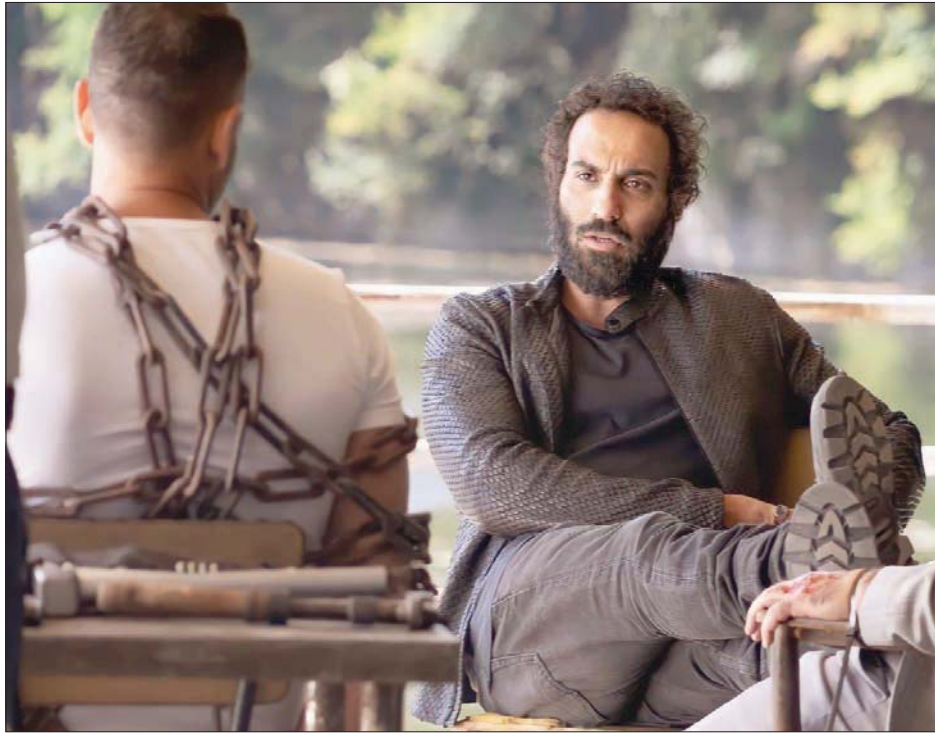
فهمي في لقطة من فيلم «العارف»