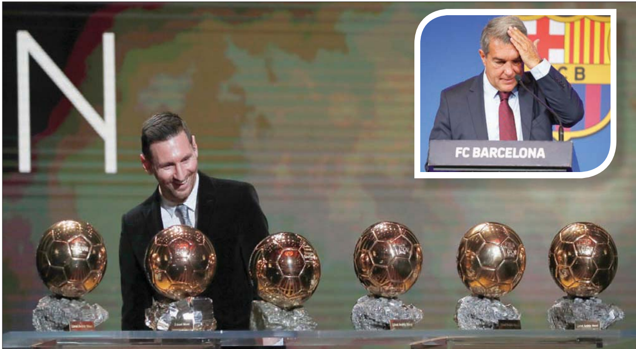
ميسي حصد 6 كرات ذهبية لأفضل لاعب بالعالم وهو في صفوف برشلونة... وفي الاطار لابورتا يعلن أمس نهاية قصة ميسي مع برشلونة (أ.ب)

غوارديولا، أو باريس سان جيرمان الفرنسي ليعلب تحت إشراف مواطنه المدرب ماوريسيو بوكيتينو، أو أي نادٍ آخر؟ عندما طلب اللاعب الأرجنتيني الرحيل عن برشلونة في صيف 2020 كان من المتوقع أن ينضم إلى مانشستر سيتي وغوارديولا، وحتى الشهر الماضي كان من الممكن أن يتحقق هذا الأمر لولا إشارات ميسي برغبته في البقاء بعد انتخاب لابورتا رئيساً جديداً للنادي الكتالوني. لكن يبدو أن سيني تجاوز الأمر بتعاقد مع صانع اللعب جاك غريليش مقابل 100 مليون جنيه إسترليني وإعطاء الأخير القميص رقم 10 الذي يرتديه ميسي دائماً سواء مع برشلونة أو منتخب الأرجنتين، وتشير وسائل إعلام إلى أن رغبة سيني في ضم هاري كين مهاجم توتنهام هوتسبير (مطلوب دفع 150 مليون إسترليني) يعني أن أبواب النادي الإنجليزي مغلقة أمام سيني والتي تملك موارد غنية قد ترى التعاقد مع ميسي مجازاً فرصة لا يمكن إهدارها.