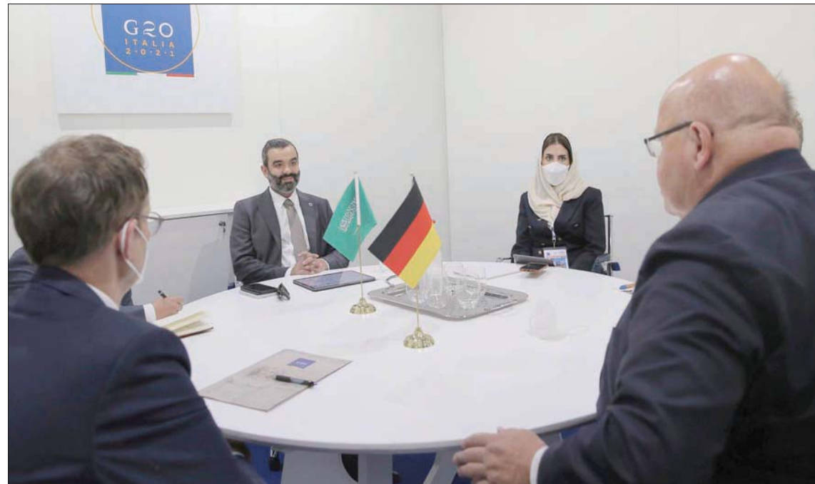
السعودية تواصل العمل على تحريك ملف اقتصادات الرقمية والفضاء، بتفعيل الشراكات العالمية (الشرق الأوسط)

السعودي قادة الاقتصاد الرقمي على هذا القرار، الذي أسهمت المملكة في بدء الحوار حول هذه النقلة في عمل الفريق، وترقيتها لتكون مجموعة عمل العلاقات الثنائية بين البلدين خاصة في مجالات الاتصالات وتقنية المعلومات، والاستفادة من تطورها التقني وخبراتها المتقدمة والتميز في هذا المجال. عقب ذلك، التقى الوزير السواحة، و وزيرة الاتصالات والمعلومات والمسؤولة عن مبادرة الأمانة الذكية والأمن السيبراني في سنغافورة، جوزفين تسيو، وجرى خلاله استعراض الفرص الاستثمارية الواعدة التي تخرز بها المملكة في مجالات تقنية المعلومات والفضاء والابتكار. واختتم الجانب السعودي جولته بقاء نظيره بدولة جنوب أفريقيا، حيث تمت مناقشة فرص التعاون المشترك، لتسريع تبني التقنيات الحديثة، وتحفيز زيادة الأعمال الرقمية والشراكة في مجال البحث والتطوير والابتكار.