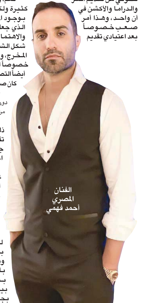
الفنان المصري أحمد فهمي

والدراما والأكشن في أن واحد، وهذا أمر صعب خصوصاً بعد اعتيادي تقديم