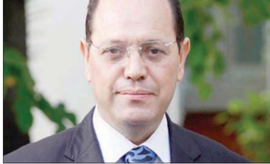
وزير المالية التونسي السابق بسباس

والقانوني وزير المالية السابق للأزمة الجديدة التي تمر بها تونس والتي توشك أن تستحل بحكم مضاعفاتها المالية والاقتصادية ومخاطرها الأنيق؟ أنا متفائل على المدى المتوسط والبعيد بمستقبل بلادي... ويمكن أن أكون متفائلاً أيضاً على المدى القريب. اعتقد أن تونس، لأسباب داخلية وإقليمية ودولية، ستواصل تحتمل إلى حل أزمتها السياسية والاقتصادية والاجتماعية في أقرب وقت. تحتاج البلاد إلى «دورة جديدة» (أي إلى عشر سنوات جديدة) لاستعادة الأمل وإعادة البناء، والمخاطف في تاريخ تونس يكشف أنه تعاقب دورات وأجيال ويتسارع، تقريبا في كل عشوية دورة جديدة. وفي آخر كل عشوية تندس الأفاق ويسود اليأس ثم تبدأ الدورة جديدة من العمل وزرع الأمل. اليوم الأمل النخبة يجب ألا تكون جزءاً من الإحباط، لأن كل الشعوب تتأثر بدور النخب، وعندما تستقط