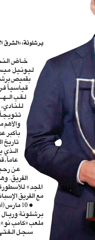
سجل الفتي الذهبي، ابن

برشلونة، «الشرق الأوسط» خاض النجم الأرجنتيني ليونيل ميسي 778 مباراة بقميص برشلونة محققاً رقماً قياسياً فريداً، نال خلاله لقب الهداف التاريخي للنادي، والسابع الأكثر تنويجاً بالانصارات، والأهم من ذلك كله أنه فاز بأكثر عدد من الألقاب في تاريخ النادي الكتالوني الذي يبلغ عمره 121 عاماً، قبل أن يتم الإعلان عن رحيله عن صفوف الفريق. وهنا أبرز «لحظات المجد» للأسطورة والقائد الأبدى مع الفريق الإسباني... 10 مارس (آذار) 2007: تعادل برشلونة وريال مدريد 3 - 3 في ملعب «كامب نو». سجل الفتي الذهبي، ابن