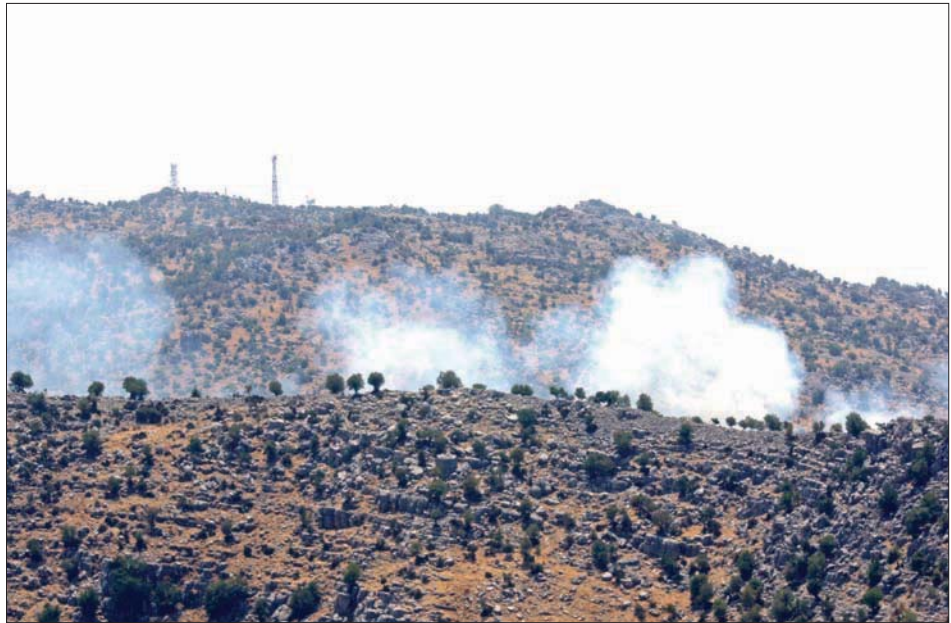
بيروت، «الشرق الأوسط»

اعتز الوضع الأمني في جنوب لبنان، أمس، بعد إطلاق «حزب الله» رشقات صاروخية باتجاه موقع عسكري إسرائيلي في منطقة مزارع شبعا التي يعتبرها لبنان أرضاً محتلة، رداً على غارات إسرائيلية جنوب لبنان. وبقيت العملية في إطارها المسدود، حيث لم يتعد الرد الإسرائيلي على قصف «حزب الله» الأماكن غير المأهولة، ولم يعلن عن إصابات أو أضرار مادية. وأعلن حزب الله أنه «عند الساعة 11:15 دقيقة من قبل ظهر الجمعة (أمس) وردت على الغارات الجوية الإسرائيلية على أرض مفتوحة في منطقتي الجرمق والتشواكير ليلة الخميس الماضي، قامت مجموعات في المقاومة الإسلامية بقصف أراض مفتوحة في محيط مواقع الاحتلال الإسرائيلي في مزارع شبعا بعشرات الصواريخ من عيار 122 ملم». وقالت قيادة الجيش اللبناني إن القوات الإسرائيلية «أطلقت قذائف مدفعية باتجاه الأراضي اللبنانية، سقط منها عشر قذائف في خراج بلدة السدانة، وثلاثون قذيفة في خراج بلدتي بسطرة وكفرشوبا، ما أدى إلى اندلاع عدد من الحرائق، وذلك بعد أن أطلق عدد من الصواريخ من الأراضي اللبنانية باتجاه مزارع شبعا المحتلة». وذكرت أن وحدة من الجيش «أوقفت في بلدة شوبا أربعة أشخاص قاموا بإطلاق الصواريخ وضبطت الرماحة المستخدمة في العملية». وأشارت إلى أن وحدات الجيش المنتشرة على الأرض قامت،