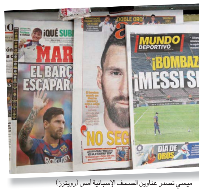
ميسي تصدر عناوين الصحف الإسبانية أمس (رويتزر)

وقالت قناة «تي واي سي سيوريس»: «من الصعب تصديق ما يحدث أنها نهاية حقبة لطالما طبعت إلى الأبد في تاريخ كرة القدم». وفي الوقت الذي بدأ فيه الجميع يتكهن بشأن الوجهة المقبلة لميسي، بدأت بعض الفرق البحث عن بديل في السوق، كما بدأت بعض الأندية الاقتصادية في الركود في هذه الدورة الأميركية الجنوبية التي تحمل عبء عودتها إلى الوطن. وبدا هاشتاغ «هلا ليو» في الانتشار على «تويتر»، حيث ظهرت صور ميسي بقمصان الأندية العربية في الأرجنتين بوكا جونيورز وريفر بلات ونوبولز أولد بويوز وسان لورنزو، بالإضافة إلى أندية أكثر تواضعاً مثل نادي ساكاشيباس.