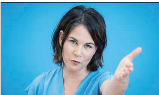
نكسة جديدة لرعيمة حزب الخضر ليبروك التي واجهت ادعاءات بارتكاب سرقات أدبية ووضع معلومات خاطئة في سيرتها الذاتية وعدم الإبلاغ عن مدفوعات تلقفتها بقيمة 25 ألف يورو

الانتخابات البرلمانية الاتحادية في ألمانيا منع قائمة حزب الخضر في ولاية زارلاند من خوض المنافسة في الانتخابات العامة المقررة في البلاد في شهر سبتمبر المقبل. وبحسب ما أورده وكالة «ولومبرغ» للأنباء، يأتي القرار بسبب مخالفات ارتكبتها مرشحاته محليون. ويشكل القرار نكسة جديدة بالنسبة ليبروك، التي واجهت ادعاءات بارتكاب سرقات أدبية، ووضع معلومات خاطئة في سيرتها الذاتية، وعدم الإبلاغ عن مدفوعات تلقفتها بقيمة 25 ألف يورو.