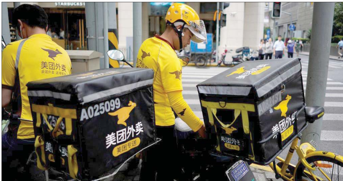
تعتزم الصين فرض غرامة بقيمة مليار دولار على شركة «ميتوان» المتخصصة في خدمات توصيل الطعام

71,19 دولار للبرميل بحلول الساعة 14:00 بتوقيت غرينتش، كما تراجعت العقود الآجلة لخام غرب تكساس الوسيط الأميركي 26 سنتاً إلى 68,83 دولار للبرميل. والعقود