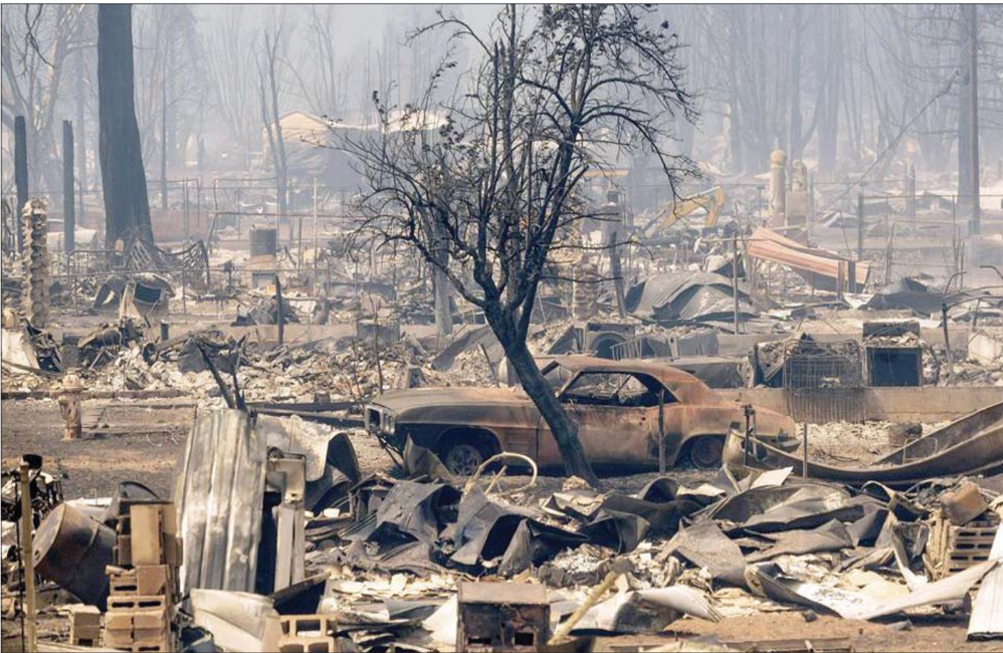
النازل والسيارات التي دمرتها الحرائق في بلدة غرينفيل بمقاطعة بلوماس كاليفورنيا أول من أمس