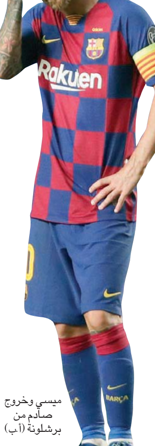
ميسي وخرج صادم من برشلونة