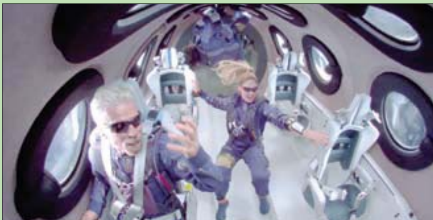
ريتشارد برانسون على متن مركبة «سبيس شيب» الشهر الماضي

المدرجين على قائمة للأشخاص الذين أبدوا اهتمامهم بصورة مبركة». وفضل رئيس فيرجن غالاكتيك جدول الرحلات المستقبلية، إذ من المقرر إجراء رحلة تجريبية جديدة، مع التركيز على عرض البحث العلمي، نهاية سبتمبر (أيلول) مع سلاح الجو الإيطالي.