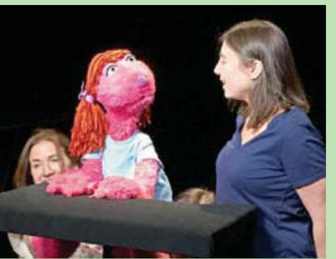
الدمية الناطقة تساعد على تحسين مهارات أطفال التوحد

تناوبت الدمية وفيوليت على التحدث واللعب بالكرة. وظهرت الدراسة أن «كلتا المجموعتين كانتا تختبئان للدمية الناطقة». وظهرت أيضاً أن «فائدة الدمية كانت متشابهة في الأطفال الذين يعانون من أعراض أقل وأكثر حدة». وتشير النتائج إلى أن الدمى يمكن أن تصبح مفيدة لتعليم الأطفال المصابين بالتوحد ومحفز لهم على الانخراط في الأنشطة الاجتماعية.