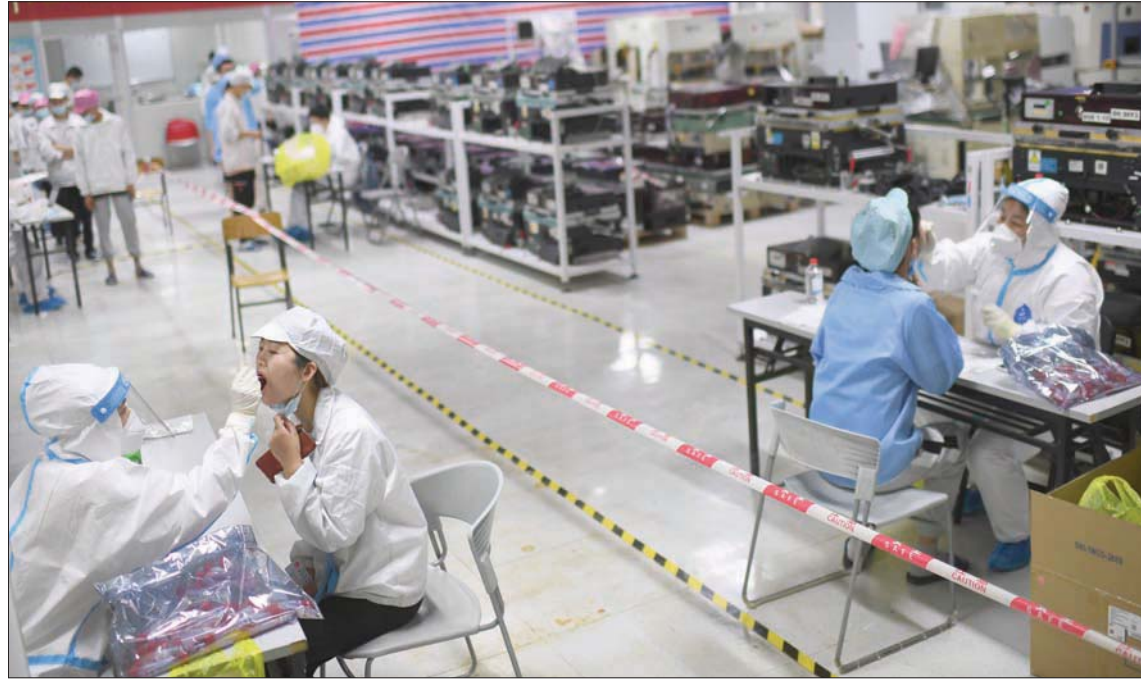
حملة فحص مكثفة لعزل إصابات «كورونا» بصنع في ووهان الخميس

90 يوماً تنتهي أواخر الشهر الجاري. ولم تكشف أوساط مطلعة على التقرير كيف تمكنت أجهزة الاستخبارات الأميركية من الحصول على تلك البيانات، رغم أنها أبلغت المحطة بأن تلك البيانات تكون عادة متوفرة على خوادم «الشبكات السحابية»، التي جرى تحميلها من الجهات المسؤولة عن إنشاء ومعالجة هذا النوع من البيانات الجينية للفيروسات، الأمر الذي يتنجح اختراقها.