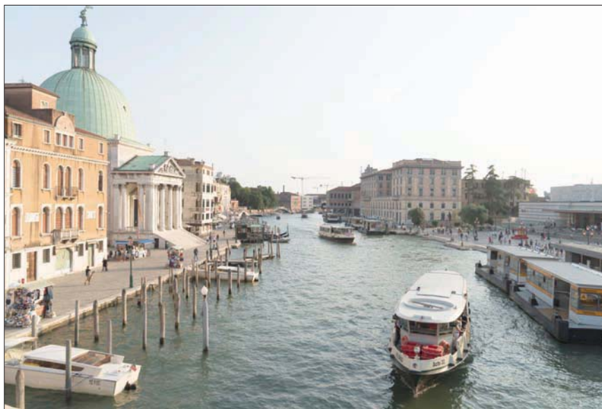
منظر لبحيرة فينيسيا

من الخطوة الإضافية للوصول إلى هنا. قال لفاكارا: «اعتقد أن ذلك صحيح» - وكانت تتدلى من عنقه حقيبة إلى جانب جسده، مع الدليل الصوتي الأزرق وبطاقات هوية - مشيراً إلى المرسوم الذي يمنع السفينة من الدخول: «إنه قرار أكثر احتراماً».