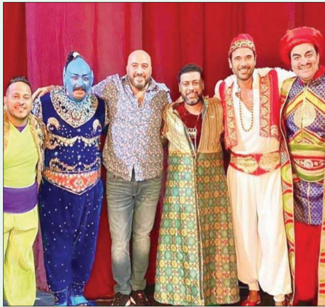
جمعة في لقطة مع أبطال مسرحية «أبو العربي»

المسؤولية لأنها ليست فريدة فالإخفاق والنجاح أمر جماعي ولن أتخلى عن العمل تحت أي بند ولدي الشجاعة لأن أقول ذلك في حال انتقاد العمل مراراً وتكراراً».