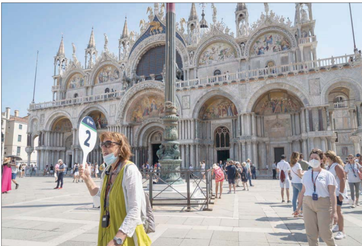
ساحة القديس مرقس أهم مقصد للسياح في فينيسيا

أعلن الحظر في الشهر الماضي، كان مع زوجته وابنه - البالغ من العمر 3 سنوات - ويصرخ «سفينة قبجة» كلما رأى سفينة كبيرة تمر أمام المقهى الذي يرفع شعار «منع السفن الكبيرة».