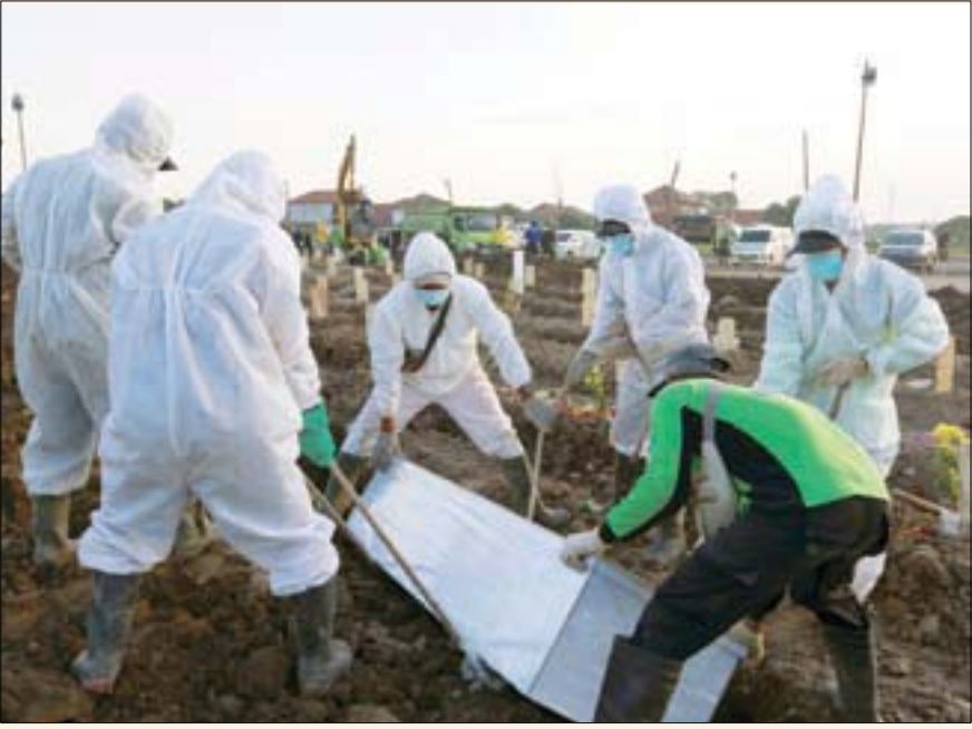
دفن إحدى ضحايا «كورونا» في جاكارتا قبل أيام