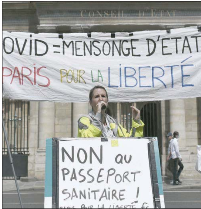
فرنسي يرفع لافتة كتب عليها «لا للجواز الصحي» خلال مظاهرة أمس (أ.ف.ب) الذي اتبعتها الولايات المتحدة لمكافحة جائحة «كوفيد»، خصوصاً أن واشنطن كانت قد أعلنت في 26 يوليو أنها

ويشكل موان، ازدياد عدد الوفيات المسجل يومياً (9350 حالياً)، ولكن بوتيرة أقل، بنسبة 20% منذ مطلع يوليو (تموز)، بعدما كان قد انخفض إلى 7800 وفاة يومياً. في الإجمال، أودى الوباء بحياة أكثر من أربعة ملايين و257 ألفاً و424 شخصاً منذ رصد الفيروس للمرة الأولى في ديسمبر (كانون الأول) 2019. وتتوقع منظمة الصحة العالمية أن يكون الرقم الفعلي أعلى مرتين أو ثلاث. تعززت الولايات المتحدة، التي أغلقت حدودها أمام غالبية الأجانب مع تفشي فيروس «كورونا»، البدء بالسماح للوافدين الذين تلقوا لقاح «كوفيد»، بالكامل بدخول أراضيها، وفق ما أفاد مسؤول في البيت الأبيض أول من أمس (الأربعاء). وقال إن واشنطن تطور «مقاربة على مراحل ستعني مع مرور الوقت أنه يتعين على المسافرين الأجانب إلى الولايات المتحدة من جميع البلاد وباستثناءات محدودة أن يكونوا قد تلقوا اللقاح بالكامل»، دون أن يحدد إطاراً زمنياً للتنفيذ. وتتمثل هذه الخطة تطوراً أولياً لكنه على قدر من الأهمية في النهج