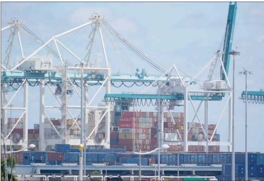
ارتفع العجز التجاري الأمريكي لمستوى قياسي في يونيو مدفوعاً بجهود الشركات لإعادة بناء المخزونات

تايمز 100 في المملكة المتحدة إذ هوى سهم مجموعة لويدز المصرفية بعد أن خفض غولدمان ساكس توصيته للسهم إلى بيع، بينما ضغط انخفاض أسعار المعادن على شركات التعدين.