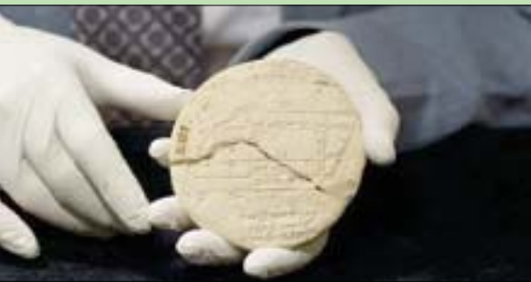
لوح طيني بابلي عمره 3700 عام (جامعة نيو ساوث ويلز)

تلك الفترة قد وضعوا طريقة لإنشاء خطوط عمودية بشكل أكثر دقة من ذي قبل، وفقاً لما ذكره مانسفيلد. ويشبه ذلك إلى حد كبير ما كنا نفعله اليوم، فقد أصبح لدينا مكان حدود أراضيهم، ويخرج المساح ولكن بدلاً من استخدام أجهزة نظام تحديد المواقع العالمي، كانوا يستخدمون ثلاثيات فيثاغورس.