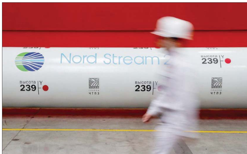
موسكو: رائد جبر

قرار تقليص إمدادات الغاز الطبيعي الروسي إلى الاتحاد الأوروبي يعزز المخاوف من أزمة جديدة