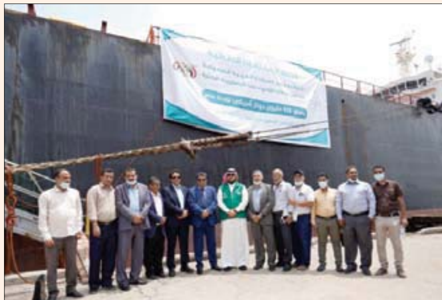
أرشييفية لوصول الدفعة الثالثة من المنحة السعودية النفطية لتشغيل الكهرباء إلى عدن الشهر الماضي

الإنجاز يأتي ترجمة لتاريخ المملكة الناصح بالعبء، وحرصها على مد يد العون لكل الشعوب والدول المحتاجة في العالم، وأضعة نصب عينيتها حياة الإنسان وكرامته وصحته أيا كان وأينما كان. ووصف الدكتور الربيعة، السعودية بأنها «نهر عطاء لا ينضب»، وستستمر على نهجها في مساعدة المحتاجين والمتضررين في جميع بقاع العالم، بتوجيهات ومتابعة ودعم من قياداتها.