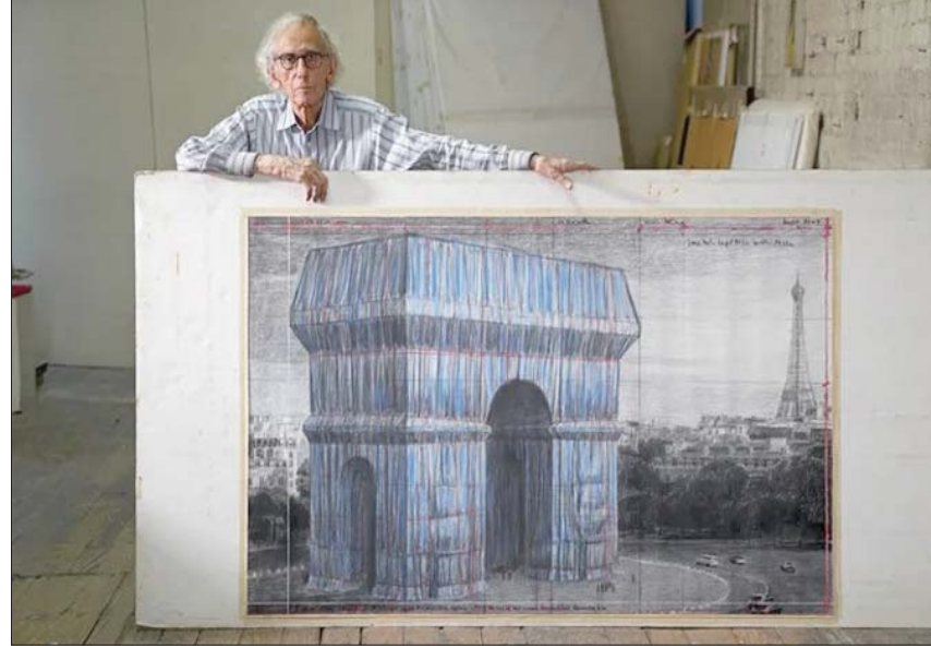
كريستو مع صورة لمشروع تغليف القوس

وحاز كريستو شهرة عالمية كمهندس لأعمال فنية مؤقتة تقوم على تغليف معالم