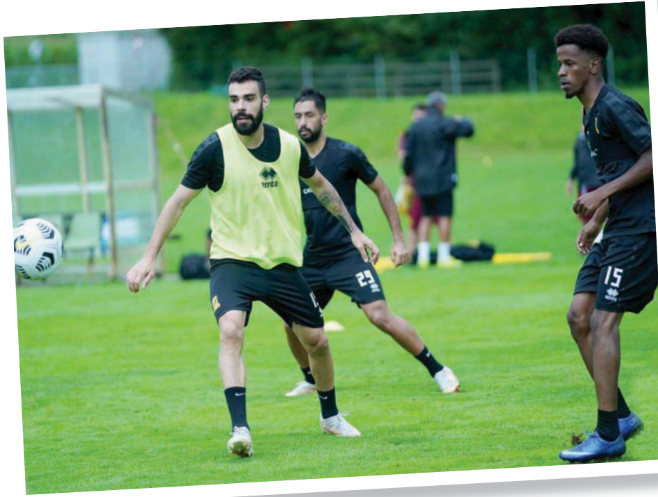
من تدريبات الاتحاد في معسكر النمسا

في استقطاب اللاعب، وفي مقدمتها بحسب الأبناء نادي النصر الذي يراقب