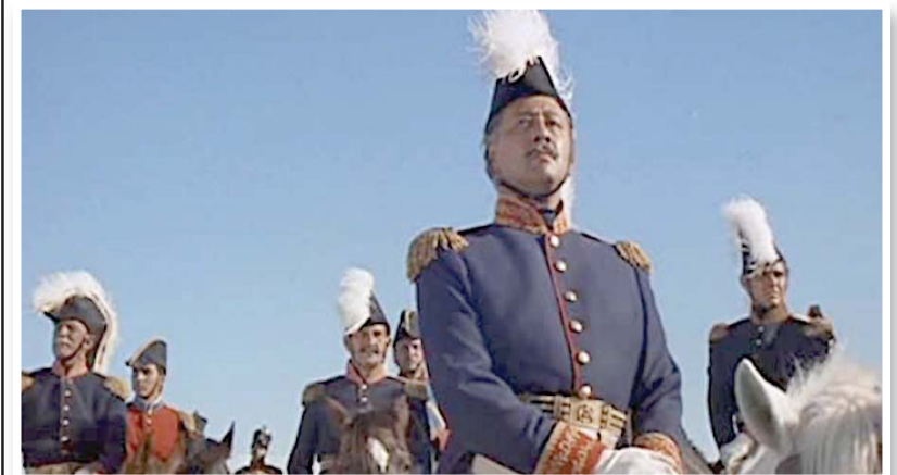
مشهد من فيلم «ذا الامو»