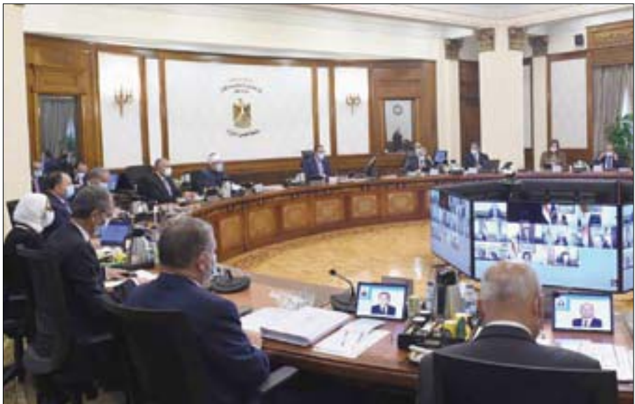
صورة نشرها مجلس الوزراء المصري في «فيسبوك» لاجتماعه لبحث مستجدات «كورونا»

المحافظات المصرية، ومتابعة الموقف أول فاول بشأن الفيروس، واتخاذ جميع الإجراءات الوقائية اللازمة ضد أي فيروسات أو أمراض معدية». وتشير القاهرة إلى أن «المخزون الاستراتيجي لأدوية علاج فيروس (كوفيد 19) آمن ومتوفر بالمستشفيات التي تستقبل المشتبه في إصابتهم بالفيروس». وكان البابا تواضروس الثاني، بابا الإسكندرية وبطريك الكرازة المرقسية، دعا المصريين إلى «ضرورة الحصول على اللقاح المضاد لفيروس (كورونا) لمنع انتشار الوباء». وطالب خلال عظته الأسبوعية مساء أول من أمس بـ«الحبطة والحذر ومنع الازدحام والتجمعات، كلما كانت هناك إمكانية». وضرورة الابتعاد عن عدوى الفيروس».