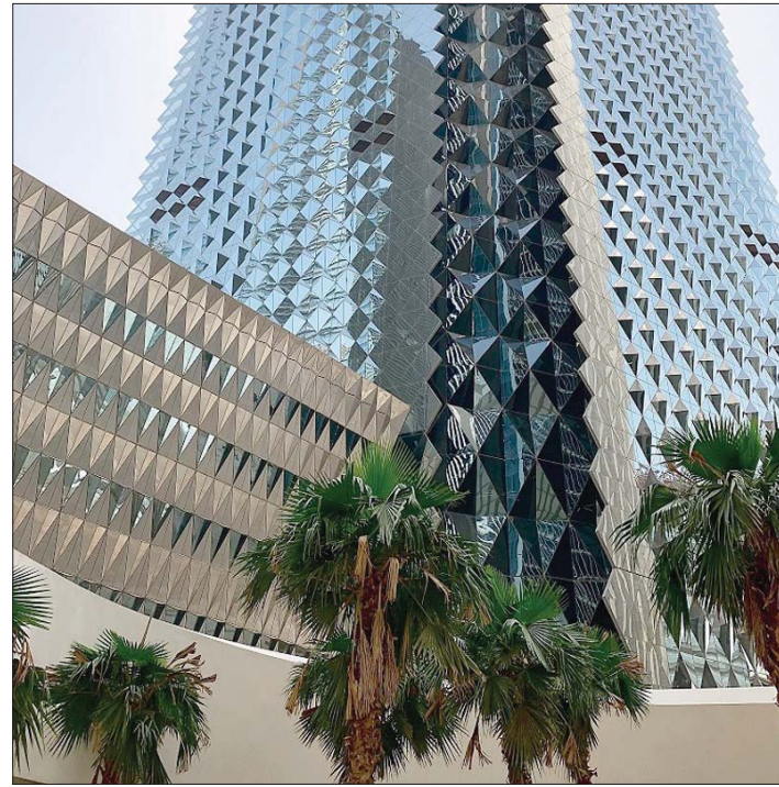
البنك الأهلي السعودي يسجل نمواً في أرباحه للنصف الأول من 2021

ورغم أن الفترة المتاحة حسب المعايير لتخصيص الشهرة وتقييم الأصول هي 12 شهراً، فإنه قد تم الانتهاء من التخصيص المبدئي