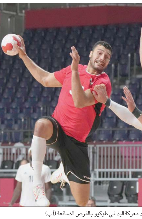
مصر خسرت معركة اليد في طوكيو بالفرض الضائعة

الاولمبياد هي المركز الثالث في ثلاث دورات أولمبية أعوام 1996 و2000 و2008 علماً بأن الفريق توج باللقب العالمي لكرة اليد في 2005 و2013. ويلتقي المنتخب الدنماركي في النهائي ضد السبت نظيره الفرنسي في مواجهة مكررة لنهائي أولمبياد ريو دي جانيرو 2016، والذي جمع بين نفس الفريقين قبل أن يتوج المنتخب الدنماركي بالذهب. وفيما يخوض المنتخب الدنماركي النهائي الأولمبي للمرة الثانية فقط في تاريخه، سيخوض المنتخب الفرنسي المباراة النهائية في الأولمبياد للدورة الأولمبية الرابعة على التوالي، حيث سبق له الفوز بالذهب في أولمبياد 2008 ببيكين و2012 بلندن فيما حل ثانياً وفاز بالميدالية الفضية في أولمبياد ريو دي جانيرو 2016. وفي المقابل، ما زالت الفرصة سانحة أمام المنتخب المصري (أحفا الفراعنة) لحصد أول ميدالية أولمبية في تاريخه عندما يخوض مباراة تحديد المركز الثالث على الميدالية البرونزية