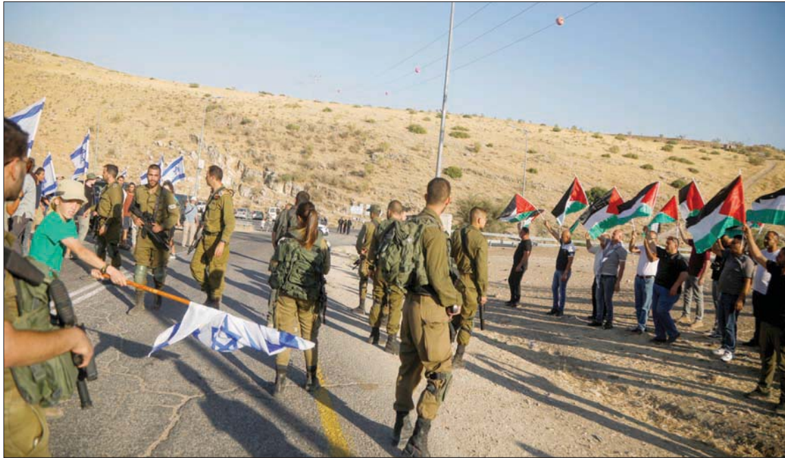
مواجهة بين فلسطينيين ومستوطنين يهود في غور الأردن بالضفة خلال يونيو الماضي

وذكرت صحيفة «هارتس»، أن وزارة الأمن الإسرائيلية، حشدت الصندوق القومي اليهودي لشراء مئات الدونمات من الأراضي الفلسطينية