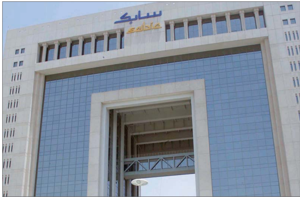
شركة «سابك» السعودية تضاعف مكاسبها مستفيدة من تحسن الطلب العالمي

في ظل مواصلة الاقتصاد العالمي طريقه نحو الانتعاش، ولفت البنيان إلى قدرة الشركة على الاستفادة من تحسن الظروف الخارجية، التي تعززت من خلال مواصلة تنفيذ برنامج التحول واسع النطاق بجانب ضبط حركة رأس المال بشكل قوي، مضيفة أن الشركة بدأت في عام 2015، برنامجها التحولي لهدف تطوير نموذجها التشغيلي وزيادة القدرة التنافسية وتعزيز الاستدامة وإعادة تدوير البلاستيك المستعمل للحلول دون تحول البلاستيك المستعمل الثمين إلى نفايات، وأوصى مجلس إدارة الشركة في يونيو (حزيران) الماضي، توزيع أرباح نقدية بقيمة 1,75 ريال للسهم الواحد عن النصف الأول من العام الحالي، بزيادة نسبتها 17 في المائة على توزيعات الأرباح النقدية البالغة 1,50 ريال للسهم الواحد للنصف الثاني من 2020.