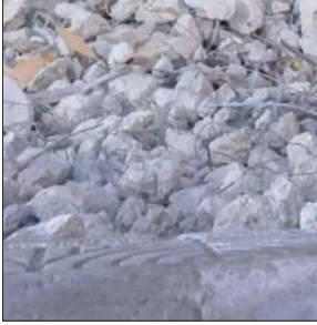
محلل يراقب إزالة حجارة أنقاض برج الشروق في غزة الذي استهدف بالغايات

حساباتها، طلبت التريث. وعبرت عن خشيتها من التعرض لدعوى تمويل «الإرهاب» ودمعه وما يؤدي إلى تصادم مع بنوك الدول الكبرى حول هذا الشأن. ونقلت صحيفة «يديعوت أحرנות» العبرية، عن مصادر في رام الله، قولها، إن المسؤول عن عرقلة الاتفاق بين قطر والسلطة الفلسطينية بخصوص