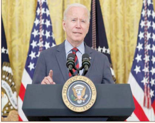
يعمل بايدن على تسريع تصنيع السيارات الكهربائية

كشفت إدارة الرئيس الأميركي جو بايدن خطتها لحماية البيئة وجعل صناعة السيارات الأميركية أكثر مراعاة للبيئة في مواجهة المنافسة الصينية والأوروبية، وتستهدف الإدارة، وفقاً لمرسوم تنفيذي أصدره بايدن الخميس، أن يكون نصف السيارات المبيعة في الولايات المتحدة بحلول 2030 معدومة الانبعاثات، ما يشمل السيارات الكهربائية