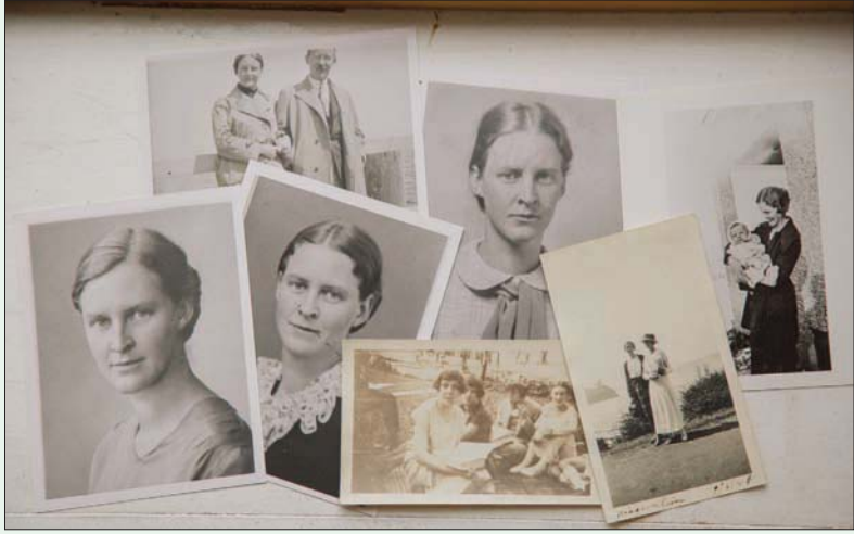
صور ميلريد هارناك الجاسوسة الأميركية خلال الحرب العالمية الثانية التي قادت مع زوجها أرفيد هارناك مجموعة مقاومة في برلين

أثار الأمر فضول دونر، لكن لم تعرف الحقيقة إلا بعد أن بلغت السادسة عشرة من عمرها: كانت ميلريد هارناك جاسوسة أميركية خلال الحرب العالمية الثانية. وقادت مع زوجها، أرفيد هارناك، مجموعة مقاومة في برلين، وخاطرت بحياتها