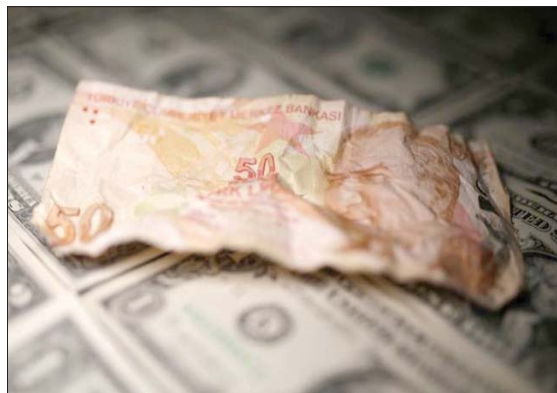
لامست الليرة التركية أدنى مستوياتها مقابل الدولار

مما يقوض جاذبية عائد العملة. كما أنه يبرع تدفقات رأس المال التي يحتاجها الاقتصاد لتمويل عجز الحساب الجاري، بحسب باجرباسيك.