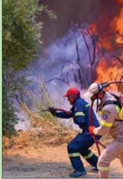
انتشرت فرق إطفاء، عدة غرب اليونان أمس بهدف التصدي لحريق ضخم قرب قرية أولمبيا الأثرية (أ.ب)

أفقره، سعيد عبد الرازق أثينا، «التشرق الأوسط» انتشر عناصر فرق الإطفاء في اليونان، أمس، للتصدي لحريقين ضخمين في غرب البلاد وشرقها، حيث آتت السنة الذهب على غابات الصنوبر. وأرسلت العديد من الفرق إلى منطقة قرب قرية أولمبيا القديمة، بهدف حماية الموقع الأثري حيث أقيمت الألعاب الأولمبية الأولى في العصور القديمة، في غرب شبه جزيرة بيلوبونيز. وتم إخلاء القرية القديمة عادة ما تكون مزدحمة بالسياح، بالإضافة إلى ست مدن أخرى مجاورة أخلت من سكانها في اليوم السابق. وتجتاح اليونان عشرات الحرائق منذ أسبوع، جراء «أسوأ موجة قيط» منذ أكثر من ثلاثين عاماً، وفقاً لرئيس وزراءها كيرياكوس ميتسوتاكيس، مع درجات حرارة تتراوح بين 40 و45 درجة مئوية. وفي تركيا، دخلت حرائق الغابات يومها التاسع أمس، وسط جهود مكثفة للسيطرة عليها. وقامت السلطات بإجلاء 10 آلاف و500 شخص من ميلاس جنوب غربي البلاد، بعد أن ناقمت الحرائق وياتت على مقربة من محطة للطاقة الحرارية. (تفاصيل ص 11)