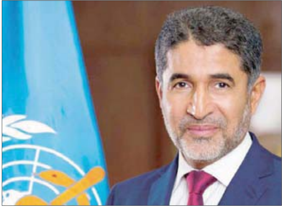
أحمد المنظري المدير الإقليمي لمنظمة الصحة العالمية لشرق المتوسط (الشرق الأوسط)

وحول آخر المستجدات بشأن تحورات فيروس كورونا وعدد