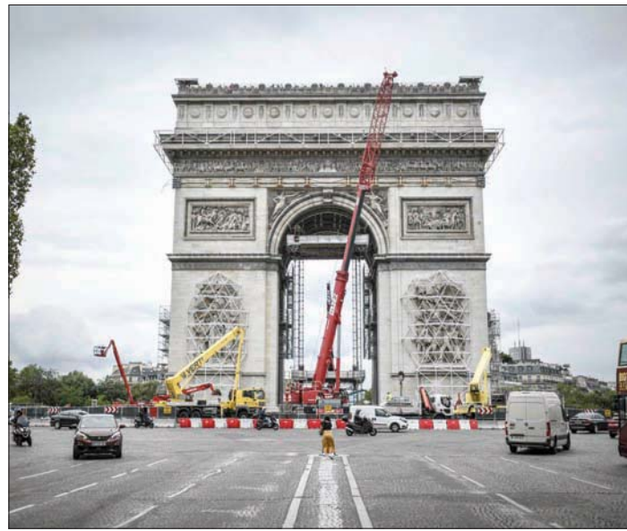
بدء ورشة تغليف قوس النصر