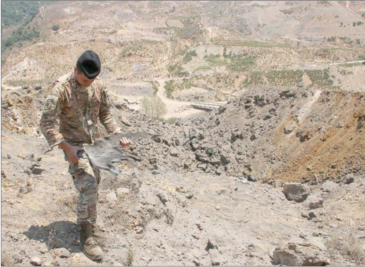
جندي لبناني يحمل بقايا قذيفة سقطت في منطقة الجنوب بعد الغارة الإسرائيلية أمس

كشفت مصادر عسكرية مقربة من الجيش الإسرائيلي أن الحكومة الإسرائيلية فرضت قواعد لعب جديدة مع لبنان، فبعد 7 سنوات من «بلع» القذائف التي يطلقها فلسطينيون بمساندة لبنانية من جنوب لبنان باتجاه البلدات الإسرائيلية وعدم الرد عليها، نفذت أربع عمليات قصف ضد المواقع التي أطلقت منها ثلاث قذائف فارغة.