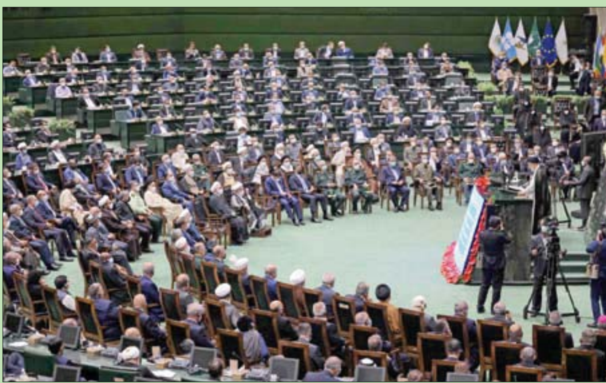
الرئيس الإيراني الجديد إبراهيم رئيسي يتحدث بعد أداءه القسم أمام البرلمان أمس