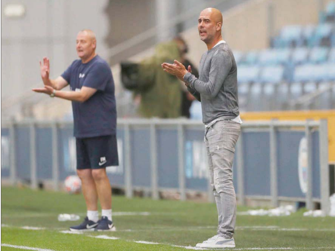
مكافوي وغوارديولا خلال مباراة مانشستر سيتي وبريستون الأسبوع الماضي

على العمل مع الفئات العمرية من تحت سن السادسة. ومع ذلك، لم يطرا على ذهنه قط تغيير حياته المهنية. وأظهرت تجربته الأولى في دورات تدريب الاتحاد الاسكتلندي لكرة القدم، التي كان العديد