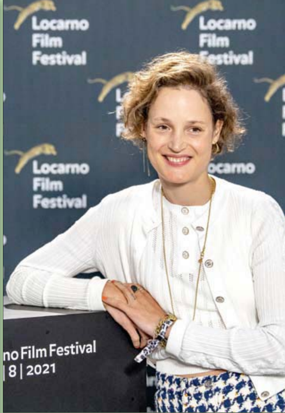
المثلة فيكي كرييس من لوكسمبورج تروج لفيلم «بيكيت» في مهرجان لوكارنو السينمائي بسويسرا