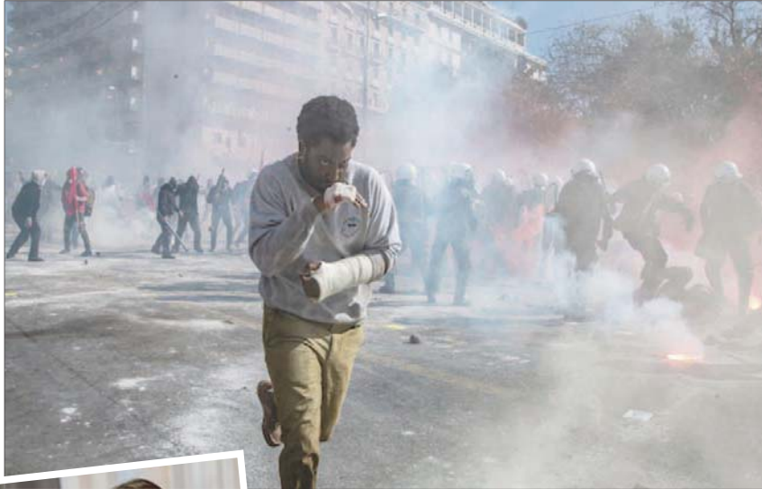
لقطة من «بكت» فيلم الافتتاح