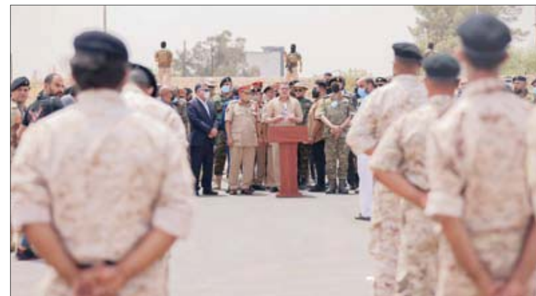
الديبية خلال زيارته منطقة طرابلس العسكرية أمس

وأعلنت المنقوش أنها بحثت، أمس، مع رئيس هيئة الرقابة الإدارية «الإجراءات المتخذة لإعادة تنظيم عمل الوزارة بما يتماشى مع القوانين واللوائح المعمول بها». في غضون ذلك، أعلنت وزارة الخارجية البريطانية أن كارولين هرنلد ستقولي مهام منصبها الجديد في سبتمبر (أيلول) المقبل كسفيرة للمملكة المتحدة لدى ليبيا خلفاً للسفير نيكولاس هوتون المنتهية ولايته. وعبرت هرنلد في بيان مقتضب عبر «تويتر»، عن سعادتها ببدء عملها خلال الأسابيع المقبلة كأول امرأة سفيرة لبريطانيا لدى ليبيا.