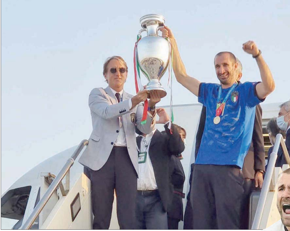
مدرب المنتخب الإيطالي مانسيني الفائز بـ «يورو 2020» اعتمد الضغط المتواصل على المنافس في مراحل البطولة

وقد كانت هناك بعض المقدمات لذلك خلال نهائيات كأس العالم الأخيرة بروسيا. إنها طريقة تنطوي على مخاطر عالية، وكانت إيطاليا محظوظة أكثر من مرة لأن لديها الصفات الدفاعية التقليدية التي تمكنها من تحقيق أهدافها في نهاية المطاف. أما بالنسبة لساونغيث، فيمكن الخطر في أنه من خلال البحث في الماضي بدقة، فإنه ينتهي به الأمر إلى خسارة المباراة الأخيرة!