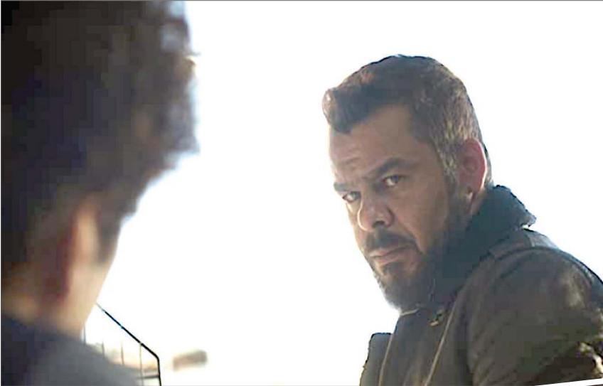
الفيلم الأردني «الأزقة»