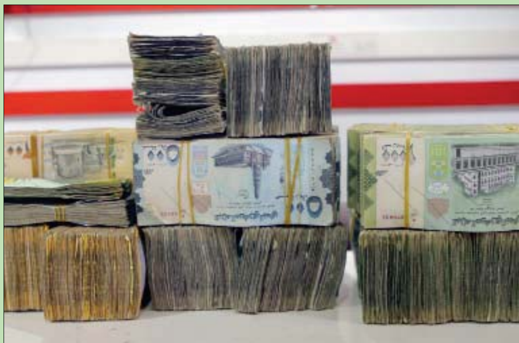
حزم نقدية من العملة اليمنية في مقر البنك المركزي في عدن

وجاء ذلك خلال اجتماع لإدارة البنك المركزي، ومقره الرئيسي عدن، من أجل تمكين البنك من تنفيذ إجراءات التحقق من جميع عملياتها والنقش الميداني المباشر لمؤيداتها «والناك من التزام البنوك بالوفاء بجميع المتطلبات القانونية اللازمة لها». البنك المركزي حمل البنوك التجارية والإسلامية التي لم تسلم