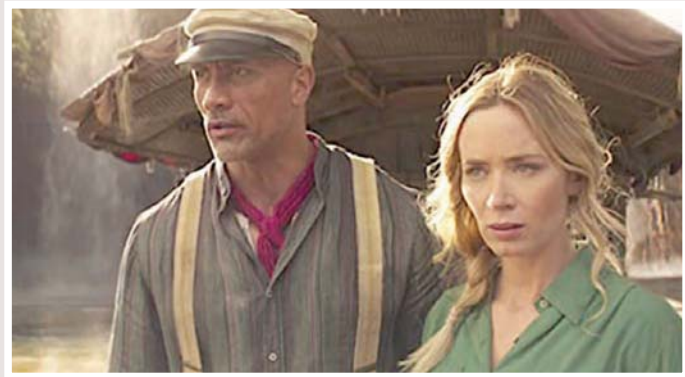
إيميلي بلنت ودواين جاكسون في «رحلة أدغال»

سلسلة من أفلام حيدر القصيرة التي تبحث في الهوية الشخصية للمهاجرين أو مولودين من أصول عربية في إيطاليا (كحاله مثل «على وشك أن تمطر» (2013) و«بلا حدود» (2016) و«ناتما بإخراج جيد.