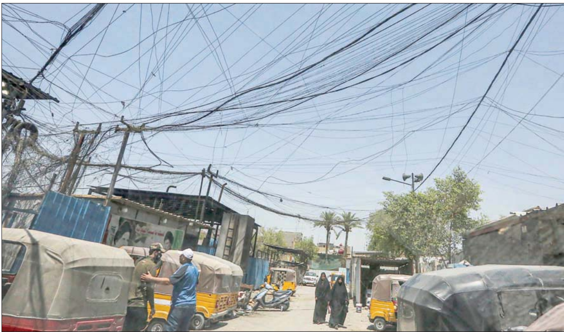
كابلات منتشرة لتزويد مولدات كهربائية خاصة في مدينة الصدر

أبراج الطاقة، وقال الجبارة لـ«الشرق الأوسط» إن «من الواضح وجود جماعات تعمل بشكل ممنهج على التخريب بقصد الاستفادة لاحقاً من مزايا التعمير. ليس لدي أدنى شك في ذلك. الأمر يتعدى مشكلة الإرهاب وأهدافه».