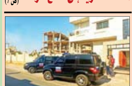
هجوم على قوات النظام في درعا (ص 8)