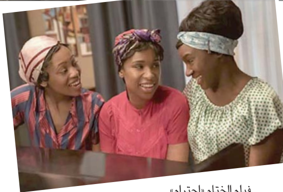
فيلم الختام «احترام»

يقوم رايمان رينولدز بالبطولة ويحاصره الممثل - المخرج النيوزلاندي تايكا وايتيكي