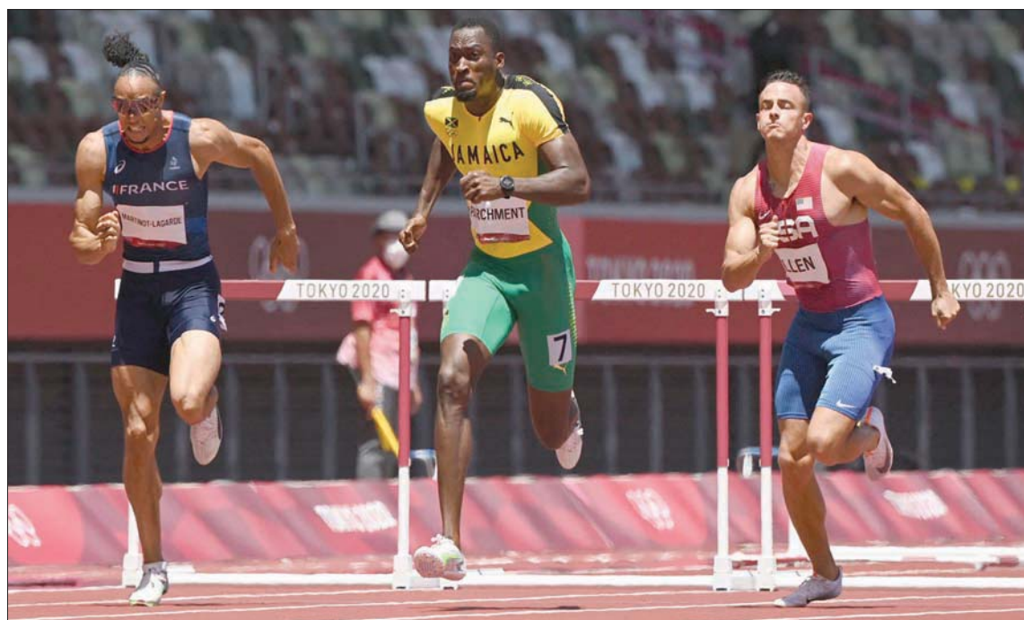
الجامايكي هانسل بارتشمنت (أب)

طوكيو، «الشرق الأوسط» إن كان الجامايكي هانسل بارتشمنت مفاجأة أمس الخميس بحسبه موقعة 100م حواجز أمام المرشح الأميركي غرانت هولواي، فقد دخلت ثلاثة أسماء التاريخ بأول القاب منافسات الكاراتيه في موطئها الأساسي بطوكيو، التي ستشهد تجدد الموقعة الأمريكية الفرنسية في نهائي كرة السلة. وسجل بارتشمنت البالغ 31 عاماً 13,04 ثانية، أمام بطل العالم هولواي (13,09 ث) ومواطنه رونالد ليفي (13,10 ث). وهذه أول خسارة في 17 سباقاً لهولواي الذي أصبح هذا الصيف صاحب ثاني أفضل توقيت في التاريخ (12,81 ث)، بفارق 1 في المائة من الثانية عن الرقم العالمي المسجل باسم أريس ميريت في 2012. وهذا أول لقب كبير لبارتشمنت صاحب برونزية لندن 2012 وفضية موندبال 2015. أصيب في 2016 ولم يكن قادراً على المشاركة في أولمبياد ريو 2016. كما غاب عن موندبال الدوحة 2019 ولم يكن ضمن دائرة المنافسين في آخر سنتين.