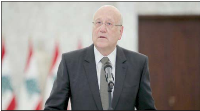
الرئيس نجيب ميقاتي متحدثاً أمس بعد لقائه رئيس الجمهورية (اللائي ونهاراً)