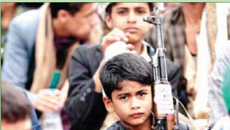
طفل يمني يحمل سلاحاً خلال تجمع في صنعاء

وشدد على أن تلك الخطوات تشكل انتهاكاً صارخاً للقوانين والمواثيق الدولية، داعياً إلى تقديم المسؤولين عنها من قيادات الجماعة للحاسبة، باعتبارهم «مجرمي حرب».