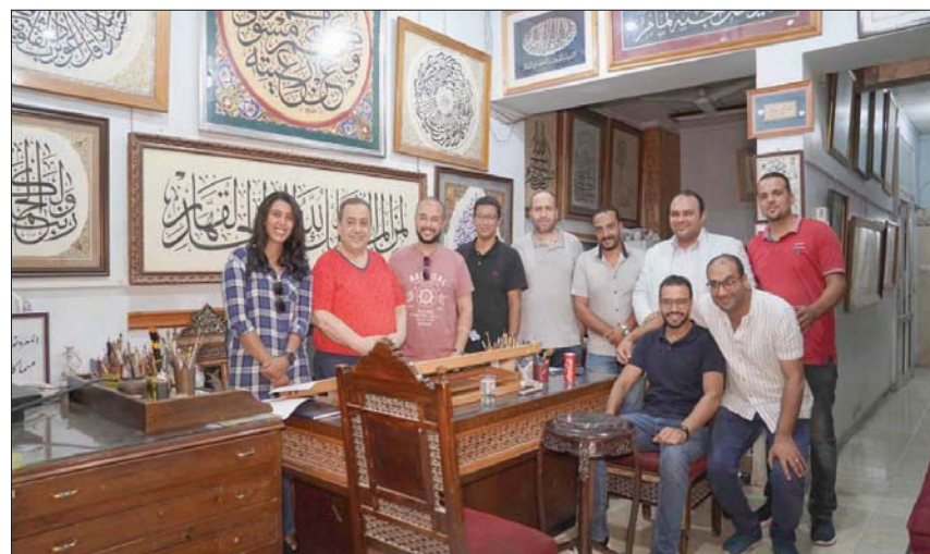
جانبا من مجموعة «البورسعيدي» المهداة للمكتبة

وتضمن الهدء 30 لوحة، توثق دور الفنان خضير البورسعيدي في تطوير المدرسة المصرية في الخط العربي من حيث صياغة الفنون المتكثرة المتعلقة بالخط العربي، بالإضافة إلى إبداعاته في تشكيل الحروف العربية والتكوينات الهندسية. وتعددت أساليب تنفيذ اللوحات التي تم إهدائها إلى المكتبة ما بين تنفيذ بالذهب والفضة وزخارف عربية وفارسية وعثمانية، وتعكس مقدرة البورسعيدي كواحد من الخطاطين المهتمين في الخط أو الزخرفة الحديثة والتقليدية،