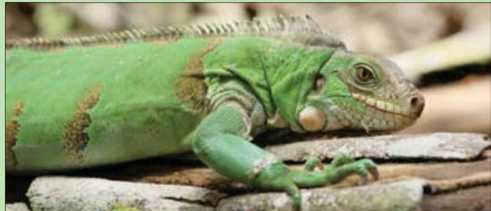
كيتو - لندن، «الشرق الأوسط»

الفعلي لحيوانات الإيغوانا بغية إعداد خطة عمل للحفاظ عليها»، بحسب ما صرح نائباً المسؤول في منظمة «غلاباغوس كونسرفنسي» الأميركية التي تنظم هذه المهمة مع متحزه غالاباغوس لجهود الحفاظ. وفي العام 2020، عثر فريق آخر من الباحثين في منطقة بركان