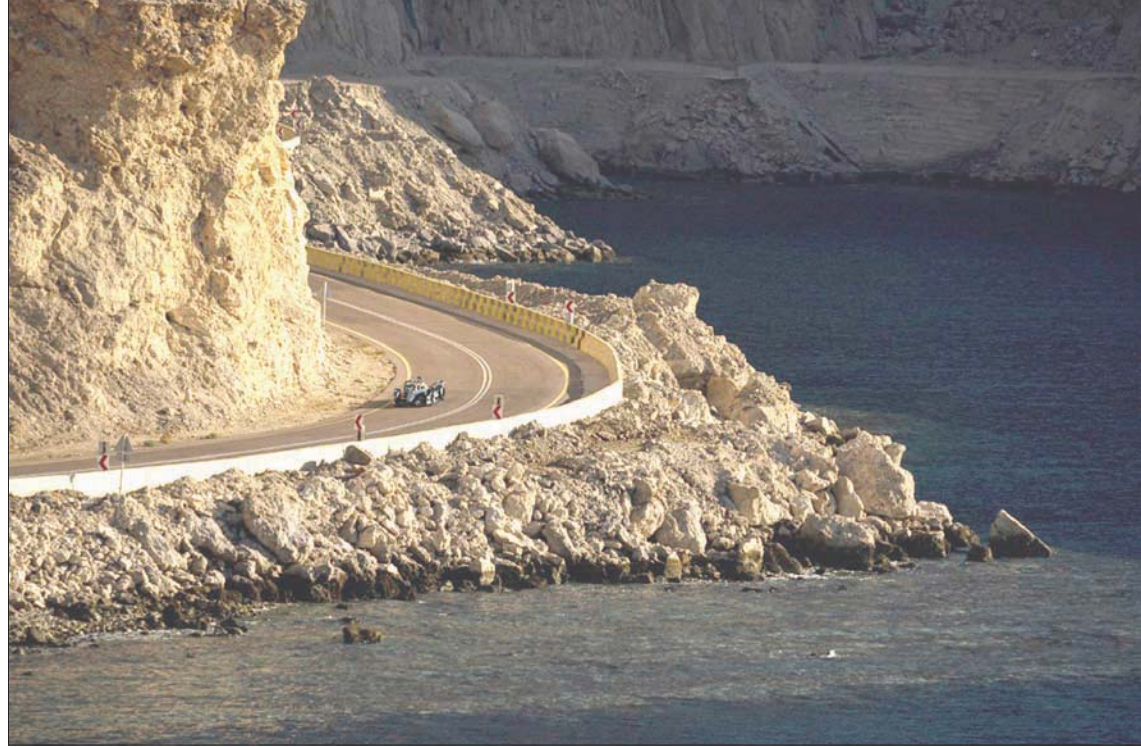
نيوم أعدت برامج مكثفة لتطوير خريجها في رياضة السيارات

ويواصل برنامج تطوير الخريجين «جي آر أو ديليو» من نيوم إتاحة الفرصة أمام الخريجين والخريجات في السعودية، بغية الوصول لأهم الكفاءات المتاحة في سوق العمل ومن ثم الانضمام إلى فريق العمل الرائد بمشروع نيوم. وشهد البرنامج التحاق 70 خريجاً وخريجة هذا العام، في بداية رحلة مهنية تتميز بسرعة إيقاعها والعمل في بيئة عالية المستوى، حيث تعتبر فرصة فريدة لهذه الكفاءات حتى تنهض دورها في إنجاز هذا المشروع العملاق، وتطبيق مهاراتها الأكاديمية في نطاق عملي احترافي واسع النطاق.