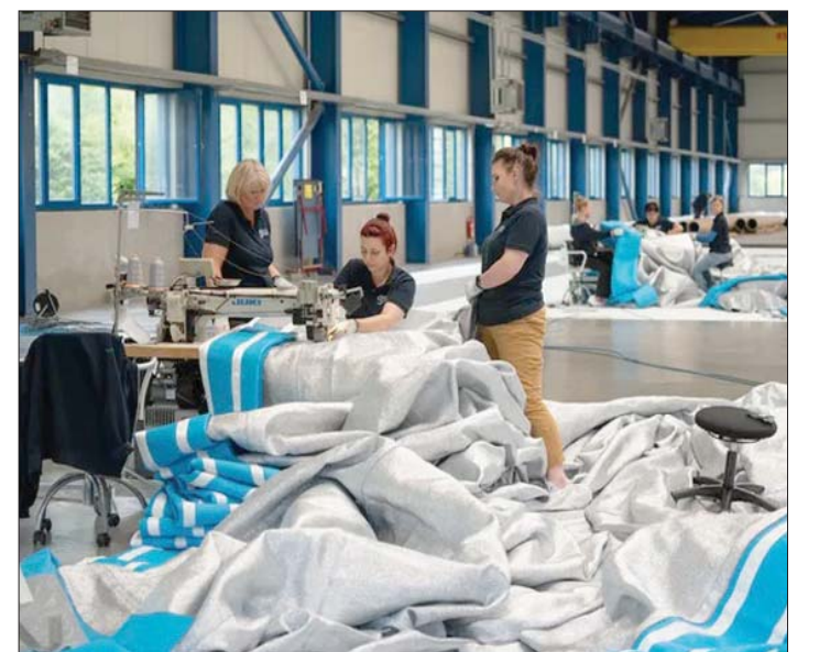
ورشة خياطة ألمانية لتحضير الكيس الكبير

طولها 10 كيلومترات فوق نهر أركنساس في كولورادو. وبعد رحيل شريكته في الحياة والعمل عاد كريستو إلى فرنسا لتقديم منحوتة ضخمة باسم «مصطبة»، في بلدة جان بول دو فانس، جنوب البلاد. وكانت المنحوتة مؤلفة من المنحوتات من البراميل النفط بالحجم الطبيعي، ملونة باللون قوس قزح. وانطلقت منذ أيام الأعمال التحضيرية لتغليف قوس النصر. وهو مبنى تعود ملكيته إلى بلدية باريس، بوشتر بتشييده أوائل القرن التاسع عشر بناء على مرسوم من الإمبراطور نابليون بعد معركة «أوسترا ليتز». وخطب الإمبراطور في جنوده قائلاً: «لن تعودوا إلى بيوتكم إلا تحت قوس أوكواس النصر». وكان يقصد تلك الأقواس التي يقفها الرومان لكي يمر تحتها