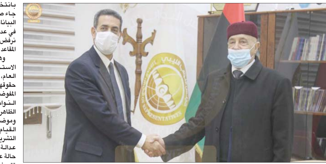
عقيلة صالح خلال لقائه رئيس مفوضية الانتخابات (مجلس النواب)

من جهته، قال السائح في تصريح إعلامي إن عملية تحديث سجل الناخبين تستهدف كل مواطن لم يسجل في العمليات الانتخابية السابقة، موضحاً أن من تم تسجيل اسمه في الانتخابات السابقة لا داعي لأن يسجل مرة أخرى، ولفت إلى أن كل ناخب لم يبادر لتسلم بطاقة الانتخاب «ن» يتمكن من المشاركة في العملية الانتخابية، وكل من تم تسجيل اسمه في الانتخابات السابقة يستطيع أن يشارك في الانتخابات المقبلة».