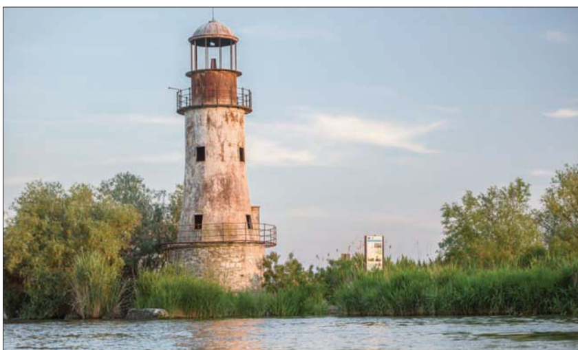
المئارة القديمة التي يعود تاريخها إلى عام 1869 في سولينا برومانيا