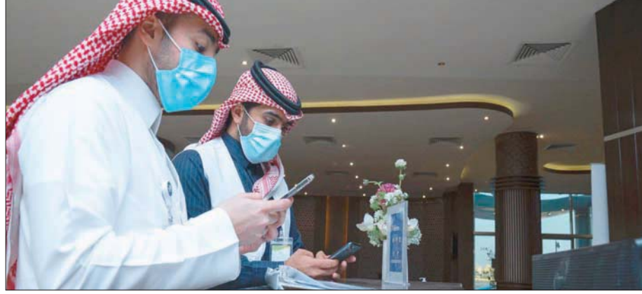
السعودية تواصل إصلاحات واسعة في سوق العمل ومبادرات لتصبح التستر التجاري (الشرق الأوسط)

الأجنبي مقيماً في المملكة قبل بدء فترة التصحيح، وعدم ممانعة صاحب عمل الشريك الأجنبي. وجدد البرنامج الوطني لمكافحة التستر دعوته لجمع الراغبين في تصحيح أوضاعهم، باستثمار هذه الفرصة عبر التقدم إلى وزارة التجارة بطلب التصحيح قبل انتهاء الفترة التصحيحية في 23 أغسطس (آب) المقبل والاستفادة من المزايا التي قررتها اللائحة، التي تشمل الإعفاء من العقوبات المقررة في النظام وما يترتب عليها من عقوبات أخرى، والإعفاء من دفع ضريبة الدخل باثر رجعي، وذلك لضمان مزاولة الأنشطة الاقتصادية بشكل نظامي.