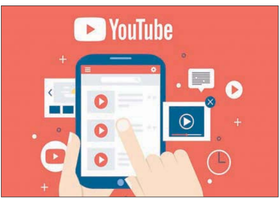
برامج وأدوات عديدة لتحرير عروض «يوتيوب»

سحب التسجيل إلى منطقة «الوح القصة» (Storyboard)، ويسمح «الوح القصة» بإداء العديد من الوظائف، ومن ثم كتابة وصف الفيديو وشكله ومدّة عرضه، ومن ثم الضغط على «تم (Done)». ويمكن استخدام أداة «القص (Trim)» من القائمة العليا لقص الأجزاء غير المرغوب فيها من الفيديو، وذلك بتحريك فاصل توفير القدرة على إضافة المؤثرات الصوتية. وبعد الانتهاء من تحرير الفيديو، يجب الضغط على أيقونة «الإنهاء (Finish)». ومن ثم اختيار جودة الفيديو النهائي من بين 1080 و720 و540 «التسلسلي (Progressive)»، ومن ثم الضغط على زر «تصدير (Export)» لحفظ الفيديو بعد إجراء التعديلات عليه.