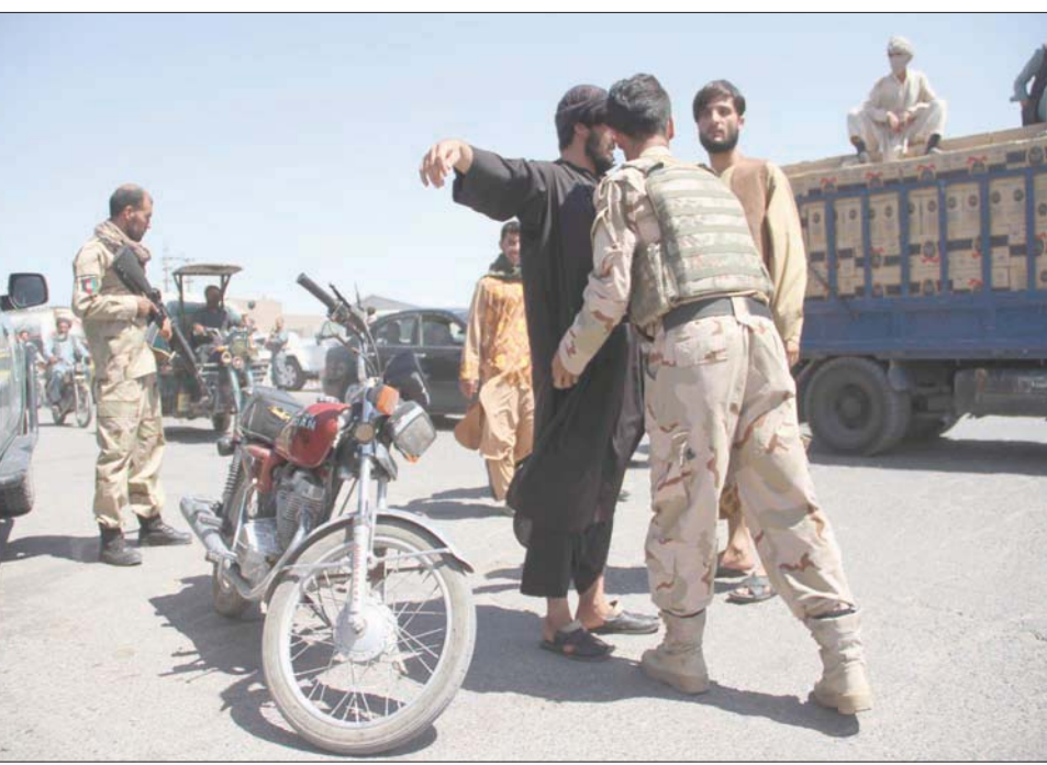
اجراءات أمنية مشددة عشية عيد الأضحى وقبل زيارة الرئيس الأفغاني أشرف غني عاصمة إقليم هيرات أمس (إ.ب.)

الحقوق، مثل مساع لإغلاق مدارس ووسائل إعلامية تناقلتها تقارير إعلامية في مناطق تمكنت «طالبان» مؤخرًا من السيطرة عليها. ونفت الحركة من قبل مثل تلك التقارير. وقالت «طالبان»، أمس، إنها سيطرت على منطقة جديدة، مشيرة إلى استيلائها على دهراود في إقليم أرزكان، إلى الجنوب الغربي من كابل، بعد اشتباكات عنيفة مع القوات