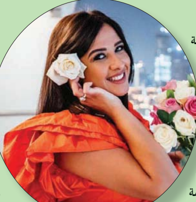
الفنانة المصرية ياسمين عبد العزيز

الصعبة التي مرت بها في عام 2021 كانت دائماً جانبياً... أرجوكم في هذا الصباح الطيب المبارك بالدعاء من قلوبكم لبنتي الغالية ياسمين عبد العزيز... يا رب أرزقها الشفاء التام والعجل يا رب». وطلب الفنان أحمد حلمي، من جمهوره ومتابعيه الدعاء لياسمين عبد العزيز، حيث كتب عبر حسابه الشخصي على موقع «إنستغرام»، «أختي الغالية ياسمين بتعمل عملية صعبة ممكن تدعوا لها تقوم بالسلامة».