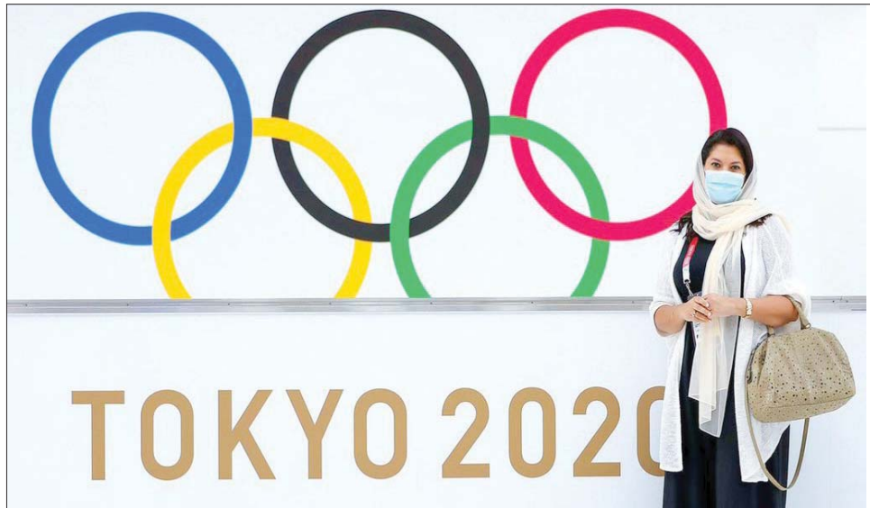
الأميرة ريما بنت بندر لدى وصولها إلى طوكيو أمس

الأولمبية مكانة بريزبين الدولية ما يجعلها أكثر جاذبية للسباح الذين يميلون إلى استخدامها كنقطة انطلاق لمناطق الجذب السياحي مثل الحاجز المرجاني العظيم.