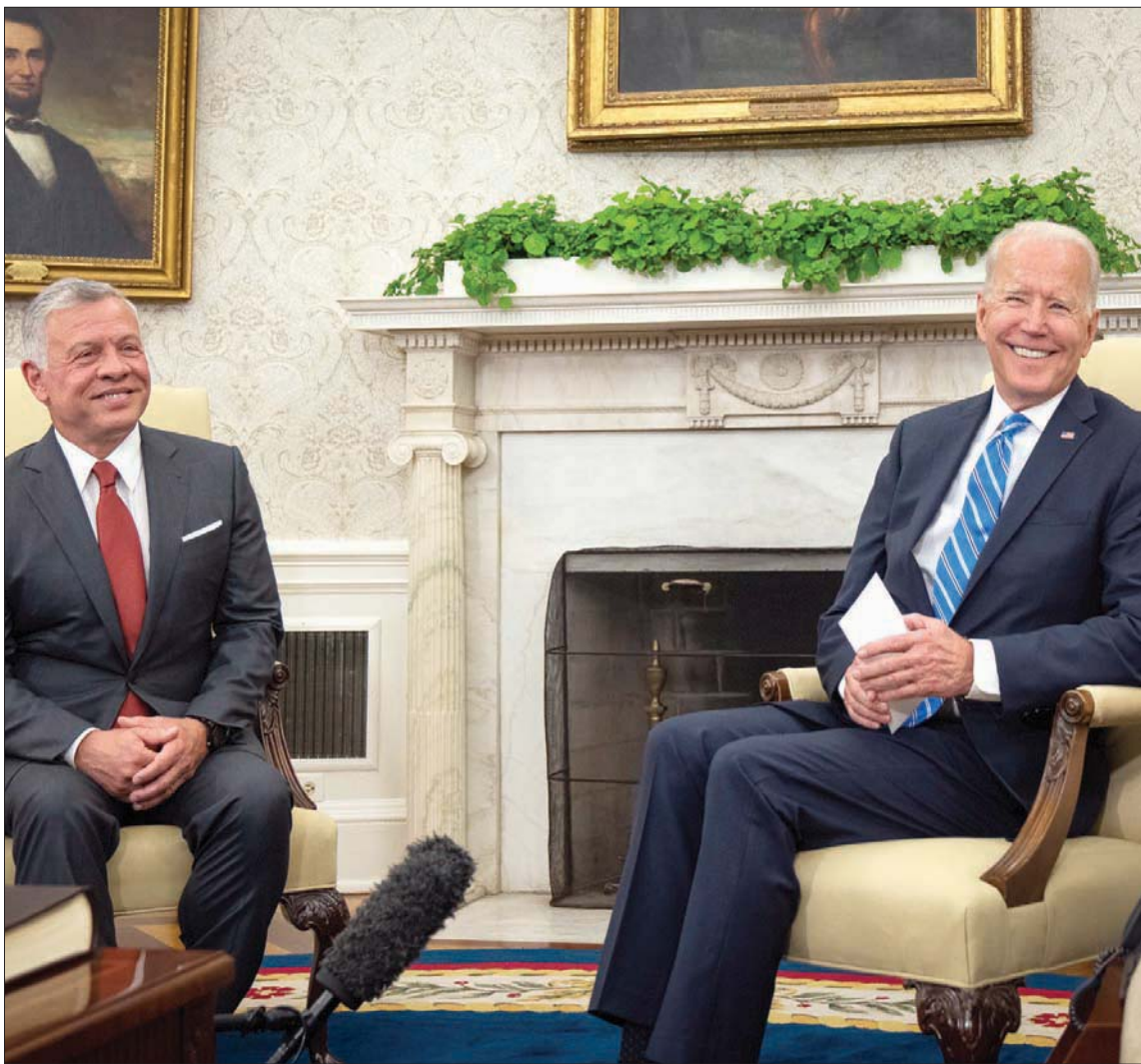
الرئيس بايدن والملك عبد الله الثاني في البيت الأبيض أمس (إب.أ)

ومن المقرر أن يستضيف بايدن رئيس الوزراء العراقي مصطفى الكاظمي يوم الاثنين المقبل بالبيت الأبيض. كما دعا بايدن رئيس الوزراء الإسرائيلي الجديد نفتالي بينيت، لزيارة البيت الأبيض الشهر المقبل. وقبل اللقاء غرّد الرئيس بايدن عبر حسابه على «تويتر» قائلاً: «أتطلع إلى استقبال الملك عبد الله بن الحسين والملكة رانيا وولي العهد الأمير الحسين بن عبد الله في البيت الأبيض ونحن ملتزمون بتعزيز الشراكة الاستراتيجية بين البلدين». وقالت المتحدثة باسم البيت الأبيض جين ساكي إن النقاشات تطرقت إلى العديد من التحديات التي تواجه الشرق الأوسط وإيران دور الأردن القيادي في تعزيز السلام والاستقرار في المنطقة». وكانت العلاقات بين عمان وواشنطن قد توترت خلال عهد الرئيس السابق دونالد ترمب وانتقد الملك عبد الله تحركات إدارته التي رأى أنها تقوض أي محاولات للتوصل إلى اتفاق سلام بين الإسرائيليين والفلسطينيين بإعلان عام 2017 عن القدس