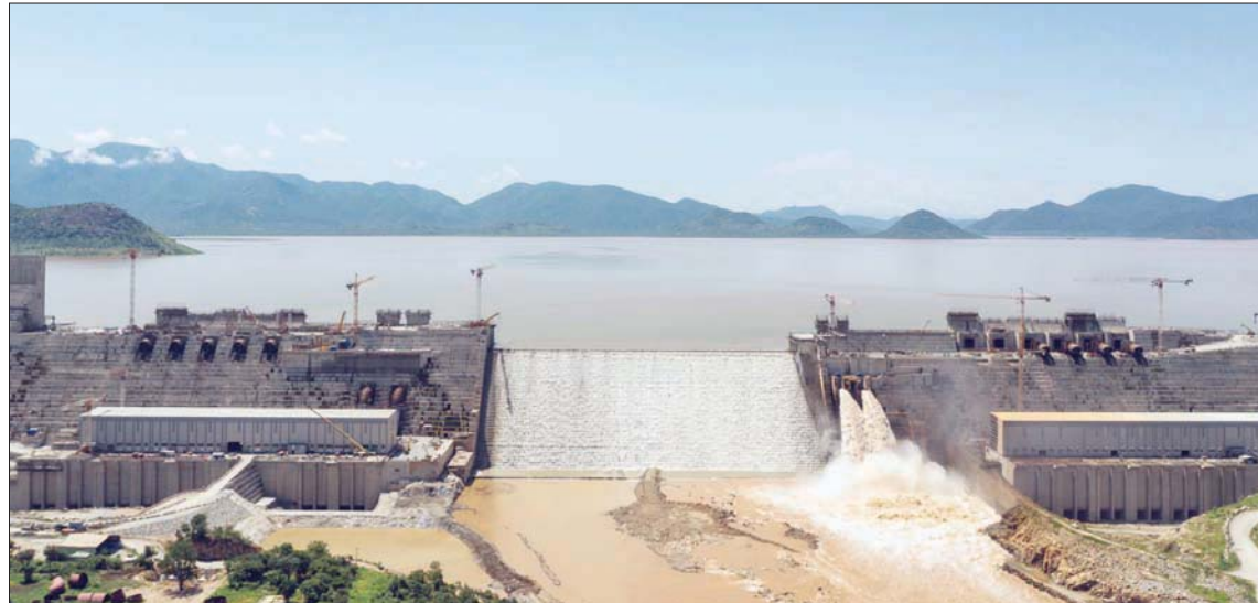
صور نشرها رئيس الوزراء الإثيوبي على صفحته بتويتر «معلناً انتهاء عملية الماء الثاني لسد النهضة

والسودان، قبل نحو أسبوعين، رسمياً ببدء الماء الثاني لسد النهضة، فيما ردت دولتا المصب باعتبار الخطوة «خرقاً صريحاً وخيطراً لانفجار المياه، وللقوانين والأعراف الدولية».