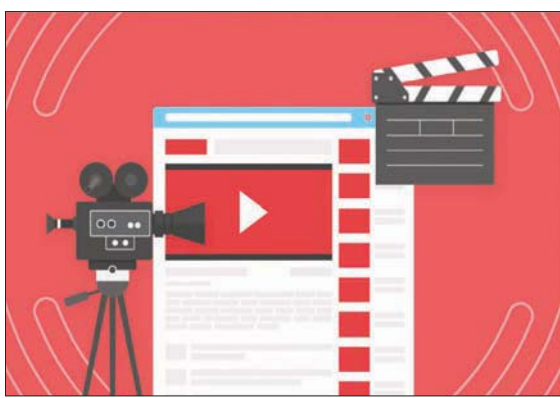
برامج وأدوات عديدة لتحرير عروض «يوتيوب»

أما إذا كنت تستخدم أجهزة «أبل» المحمولة ولا ترغب في دفع مبالغ كبيرة لقاء برامج احترافية مشهورة (مثل Final Cut Pro وAdobe Premier Pro)، فنذكر تطبيق «أي موفي (iMovie)» المجاني من «أبل» الموجود وفقاً لمتجر التطبيقات، وبعد تحميل التطبيق وتبنيته، فإنه يمكن الذهاب إلى قسم «فيلممي (My Movie)» في الشاشة الرئيسية، ومن ثم الضغط على زر «جلب ملف الوسائط (Import Media)» واختيار الفيديو الذي ترغب في تحريره، فنذكر برامج «DaVinci Resolve» و«OpenShot» و«Vn Video Editor» و«Movavi Video Editor»