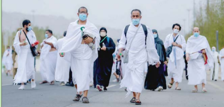
ساعدت الإجراءات الاحترازية والتنظيمية في نجاح موسم الحج

مكة المكرمة: إبراهيم القرشي وعمر البديوي