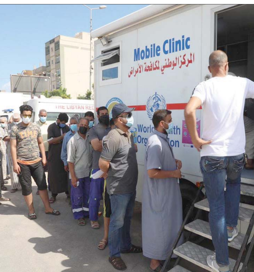
حملة تلقيح استثنائية في مدينة الخمس الليبية (المركز الوطني)