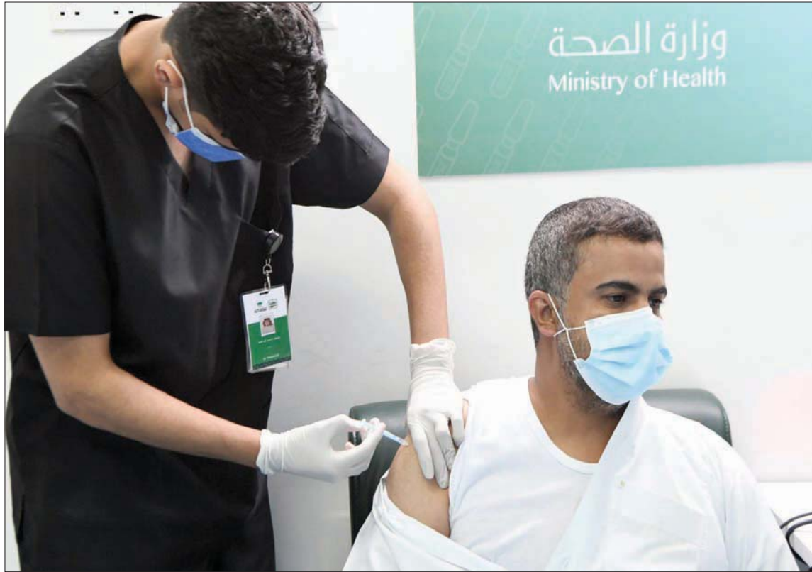
أبها تواصل التطعيم بالجرعة الثانية لجميع الفئات العمرية

وكعادتها منذ بداية الجائحة، استجابت الدول الأوروبية لتهديده الموجة الجديدة من غير تنسيق وبتباين في التدابير التي عادت وفرضتها، فالبعض فرض حظر التجول الليلي، والبعض الآخر قرر إقفال أماكن اللهو ومراكز الترفيه الليلية التي كانت تحولت إلى رمز للحرية المحلية المصري، محمود شعراوي، على الأجهزة التنفيذية بالمحافظات، «الالتزام بمواعيد غلق المقاهي، والمطاعم، والحلالم والمولات التجارية، والحفاظ على النسبة المقررة لوجود المواطنين بالمطاعم والكافتريرات، التي أقرتها اللجنة العليا لإدارة أزمة فيروس كورونا برئاسة رئيس الوزراء المصري، وكذا حظر تقديم المشيشة، واتخاذ الإجراءات القانونية تجاه المخالفين للإجراءات الاحترازية والوقائية المعلنة من الدولة المصرية». تم تطبيق نهج متعدد الأبعاد