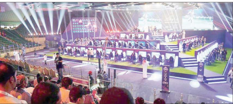
اتحاد الرياضات الإلكترونية منح هوة تطوير الألعاب خمسة برامج تعليمية (الشرق الأوسط)

وستكون رابعة الوديات التي سيخوضها الفريق العصامي أمام إيبار الإسباني يوم 30 يوليو الحالي، على أن يختم مبارياته الودية يوم السبت مطلع أغسطس المقبل، وهي المباراة التي لم يُحدد طرفها الآخر حتى الآن، حيث ستكون آخر وديات الفريق الأزرق قبل العودة إلى الرياض.