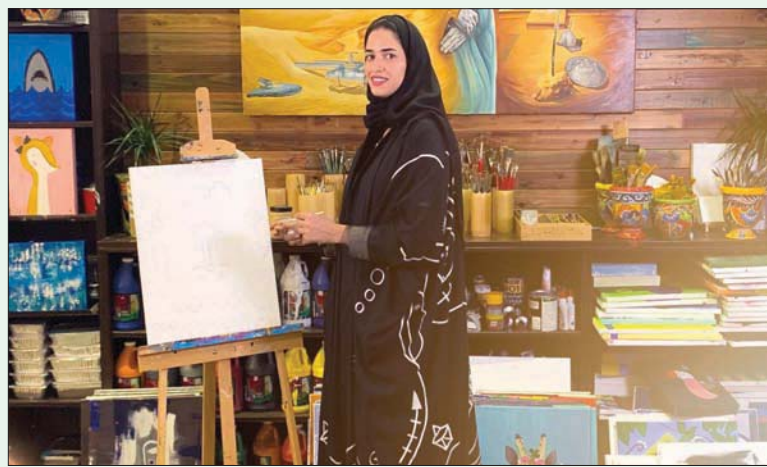
المرسم الواقع بمدينة الخبر يتيح لرواده تجربة الرسم كالمحترفين