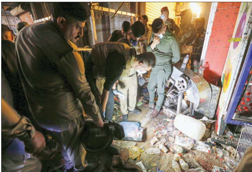
رجال أمن يعالون موقع الانفجار شرق بغداد أمس

بشكل غير مسبوq عبر الحرائق التي طالت القطاع الصحي بدءاً من الوزارة نفسها عبر مقرها في بغداد ومستشفى الحسين في الناصرية الذي خلف مئات الضحايا بين قتيل وجريح، وقبله بنحو شهرين ونصف الشهر مستشفى ابن الخطيب ببغداد، حيث خلفت الحرائق فيه مئات القتلى والجرحى أيضاً.