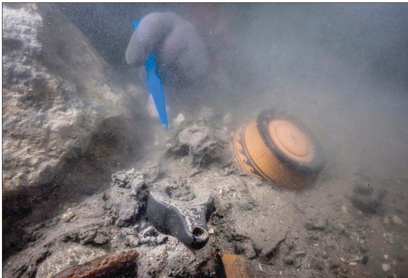
جانب من عمليات البحث عن بقايا السفينة

وهي مواقع غنية جداً تكشف كل يوم عن شيء جديد». وأعيد اكتشاف المدينتين بواسطة بعثة المعهد الأوروبي للأثار الغارقة (IEASM)، بالتعاون مع الإدارة المركزية للأثار الغارقة بوزارة السياحة والآثار، في الفترة ما بين عامي 1999 و 2001.