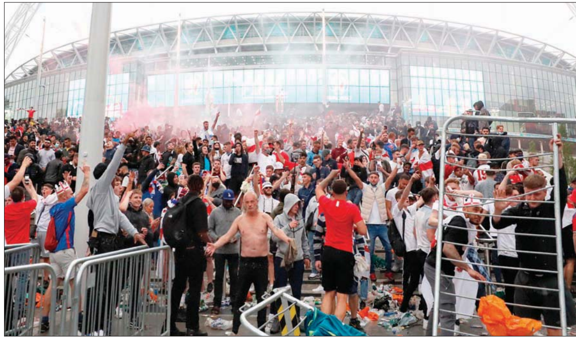
شغب جماهيري إنجلترا قبل وأثناء مباراة نهائي كأس أوروبا في محيط استاد ويمبلي

لندن، «الشرق الأوسط» أسفرت قرعة الدور التمهيدي الثالث لمسابقة دوري أبطال أوروبا التي سحبت أمس في مقر الاتحاد الأوروبي للعبة في نيون، عن مواجهة قوية بين بنفيكا البرتغالي حامل اللقب مرتين وسبارتاك موسكو الروسي. ويلتقي رينجرز، بطل اسكتلندا، مع مالو السويدي أو هلسنكي الفنلندي، فيما يلعب غريمه التقليدي سلتيك، في حال تخطيه ميدتيلاند الدنماركي، مع ايندهوفن الهولندي و غلاطة سراي التركي.