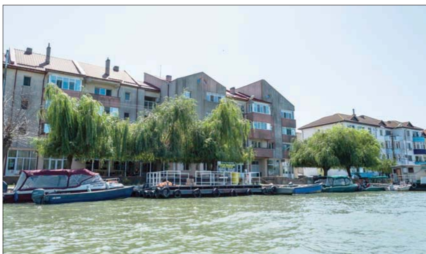
سولينا تحولت في أحد الأوقات من قرية صيد إلى مدينة أوروبية

وأين تقف سولينا اليوم؟ يقول لافريك: «لدينا نحو 10 إلى 15 مولوداً سنوياً، لكننا لدينا أيضاً ما يتراوح بين 70 و90 حالة وفاة... كما أنه لا يكاد يوجد عمل في سولينا». وتخصب كل الأمال حالياً على السباحة، فبعد كل شيء، تعد «أوروبا المصغرة» السابقة نقطة انطلاق رائعة لاستكشاف دلتا الدانوب بتنوعها البيولوجي الفريد. ولكن لافريك يعتقد أن سولينا ما يزال لديها مستقبل.