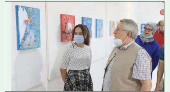
جانب من معرض مرسم الأطفال في أصيلة

أصيلة: «الشرق الأوسط» - من قارات أفريقيا وأوروبا وآسيا وأميركا. أسدل الستار، مساء أول من أمس، عن فعاليات الدورة الصيفية لموسم أصيلة الثقافي الدولي الـ42، التي تنظم تحت رعاية العامل المغربي الملك محمد السادس، وبشراكة مع وزارة الثقافة والشباب والرياضة (قطاع الثقافة)، وبلدية أصيلة. وخصصت الدورة الصيفية، التي انطلقت يوم 25 يونيو (حزيران) الماضي، للفنون التشكيلية، واشتملت على ورشات الجداريات والصبغة والحفر، فضلاً عن ورشة أطفال الموسم و«الريبيعات» ومعارض، إلى جانب ورشة كتابة الطفل. واختارت مؤسسة منتدى أصيلة أن تنظم الموسم في دورته الـ42 على فترتين، في الصيف وفي الخريف، بعدما لم تتمكن من تنظيمها سنة 2020. بسبب تفشي جائحة «كوفيد - 19»، لكنها نظمت، بالتعاون مع وزارة الثقافة والشباب والرياضة، الصيف الماضي، سلسلة من الأنشطة الفنية توعيتها سبع فقرات، شملت مشاغل صبغة على الجداريات ومعارض تشكيلية وورشات للكتابة، وذلك مساهمة من المؤسسة في إنعاش شعور السكان بالبحر والطماينة عن طريق الفنون التشكيلية كوسيلة للتعايش والشفا من تداعيات الجائحة وأثارها على مزاج السكان وصحتهم. وفيما يخص برنامج الدورة الخريفية، التي تنظم ما بين 22 أكتوبر (تشرين الأول) و12 نوفمبر (تشرين الثاني) المقبلين، تستضيف جامعة المعتمد ابن عباد المتوحفة في دورتها الـ35، ثلاث ندوات تبحث مواضيع من قبيل: «أي مستقبل للإقليمية الانتخابية؟» و«المغرب والساحل: شراكة حقيقية؟» و«العرب والمتغيرات الإقليمية والدولية الجديدة: إلى أين تتجه القومية العربية؟» وذلك بمشاركة مفكرين وخبراء