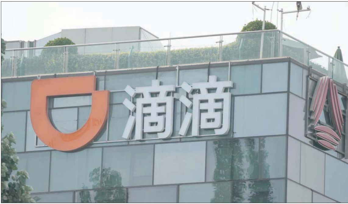
مكاتب شركة «بيدي» الصينية التي تقوم بالمراقبة الأمنية السيبرانية في بكين (أ.ب)

اتهمت إدارة الرئيس الأميركي جو بايدن، أمس الاثنين، رسمياً الحكومة الصينية بقرصنة أنظمة البريد الإلكتروني لدى شركة «مايكروسوفت» التي تستخدم على نطاق واسع عالمياً، منسقة في ذلك مع دول «حلف شمال الأطلسي (ناتو)»، والاتحاد الأوروبي، وقوى دولية أخرى، للتنديد به «الهجمات السيبرانية الخبيثة التي تنفذ وراءها وزارة أمن الدولة في بكين والمجرمين التابعين لها»، وفقاً للاتهامات الغربية. وفي أول اتهام من نوعه، أفاد البيت الأبيض، في بيان، بأن «الحكومة الصينية دفعت لجماعات إجرامية بغية القيام بعمليات اختراق لعشرات الآلاف من أجهزة الكمبيوتر والشبكات في كل أنحاء العالم؛ بما في ذلك هجمات فدية لا يترزق الشركات بملايين الدولارات»، مقابل «تكاليف علاج كبيرة لضحاياها في الغالب من القطاع الخاص». وكانت «مايكروسوفت» نفسها أشارت إلى متسللين مرتطبين بوزارة أمن الدولة الصينية لاستغلالهم ثغرات في أنظمة البريد الإلكتروني للشركة.