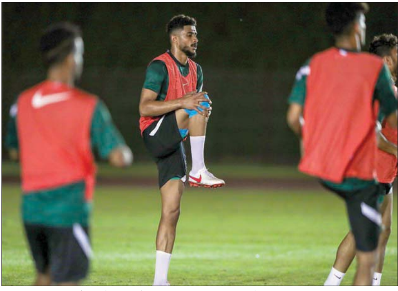
من استعدادات الأخضر لمواجهة ساحل العاج