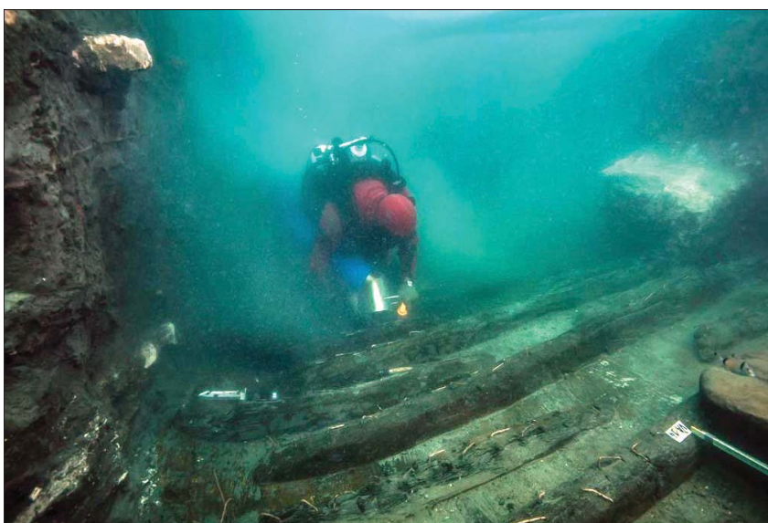
حطام السفينة الأثرية المكتشفة بالإسكندرية