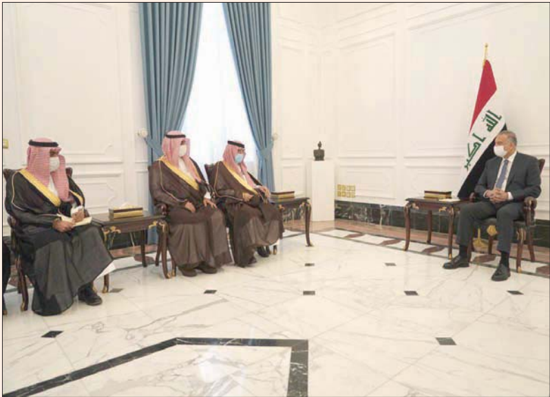
الكاظمي مستقبلاً وزير التجارة السعودي والوفد المرافق (المتكبر الإعلامي لرئيس الوزراء العراقي)

بغداد، «الشرق الأوسط»، وحصل الكاظمي الدكتور ماجد القسبي تحياته وتهانينه لخادم الحرمين الشريفين وولي العهد، بهذه المناسبة، مشيداً بمستوى العلاقات التي تربط البلدين الشقيقين، ومؤكداً حرصه على تعزيزها، والتطلع إلى مزيد من أفاق التعاون المشترك في إطار المجلس التنسيقي السعودي - العراقي، وبما يحقق مصالح شعبي البلدين.