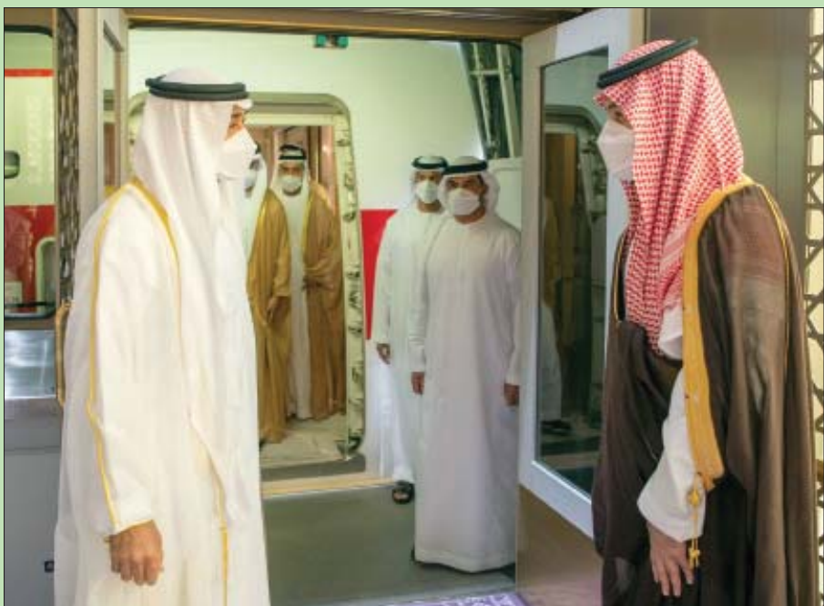
الأمير محمد بن سلمان مستقبلاً الشيخ محمد بن زايد في الرياض أمس