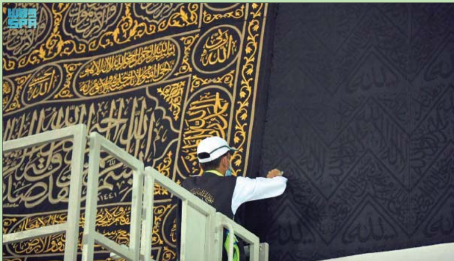
مكة المكرمة: «الشرق الأوسط»

استبدلت كسوة الكعبة في ليلة عرفة، أمس، جرياً على العادة السنوية، بـ«الثوب الأعلى» الذي يصنع من الحرير الطبيعي الخالص المصبوغ باللون الأسود ويبدأ بايات قرآنية وزخارف إسلامية مطرزة تطريزاً بارزاً بالذهب.