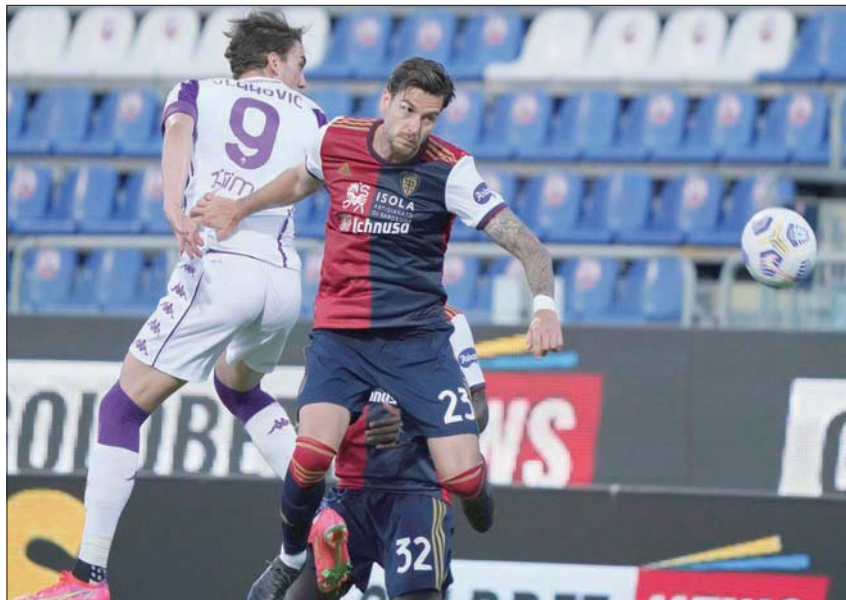
سيميوني في مواجهة فيورنتينا هذا الموسم

لكن لم يكن لدي أي فكرة عما يحدث. وفي ريفر بليت، عندما كنت في الخامسة عشرة من عمري، جاء جدي ليشاهدني