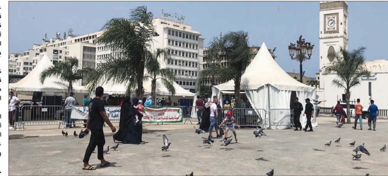
مواطنون في باحة وسط العاصمة الجزائرية أول من أمس (رويترز)

عند وزير الدفاع الأسبق إلى الجزائر في طائرة رئاسية. وفي اليوم الموالي، توجه إلى المحكمة العسكرية، حيث أبلغ بإنهاء المتابعة ضدّه في «قضية التأمّر»، في حين بقي «ملف الفساد» يلاحقه. وعلى جانب آخر، قضى 27 شخصاً على الأقل، مساء الجمعة، وفق حادثي سير في الجزائر، وفق ما نقلت وكالة الصحافة الفرنسية السبت عن وسائل إعلام محلية. وأوردت وكالة الأنباء الجزائرية الرسمية أن 18 شخصاً بينهم ستة أطفال قضوا مساء الجمعة جراء اصطدام بين حافلة ركاب وشاحنة على طريق تربط بين قسنطينة وجيجل في شمال شرقي البلاد. وفي برج باحي مختار في أقصى جنوب البلاد، أوقع اصطدام بين عربة رباعية الدفع وشاحنة تسع وفيات، وفق قناة «الحياة» التلفزيونية الجزائرية. وأفادت القناة بأن أسباب الحادث قد تكون سوء الرؤية في هذه المنطقة الصحراوية. وتعد الطرق في الجزائر من الأخطر في المنطقة. وبحسب «المندوبية الوطنية للسلامة المرورية»، وهي هيئة حكومية، قضى 3275 شخصاً في حوادث سير في الجزائر في عام 2019، فيما أصيب أكثر من 30 ألفاً، وذلك في حصيلة سجلت تراجعاً طفيفاً مقارنة بالسنوات السابقة. وتعد السرعة، لا سيما بالنسبة لسائقي سيارات النقل المشترك، السبب الأبرز لحوادث السير في الجزائر.