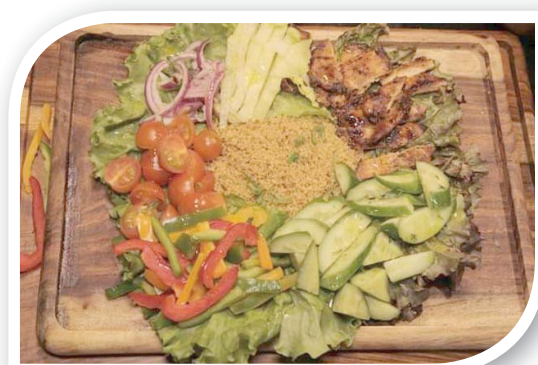
أطباق متنوعة في أجواء أرسقراطية