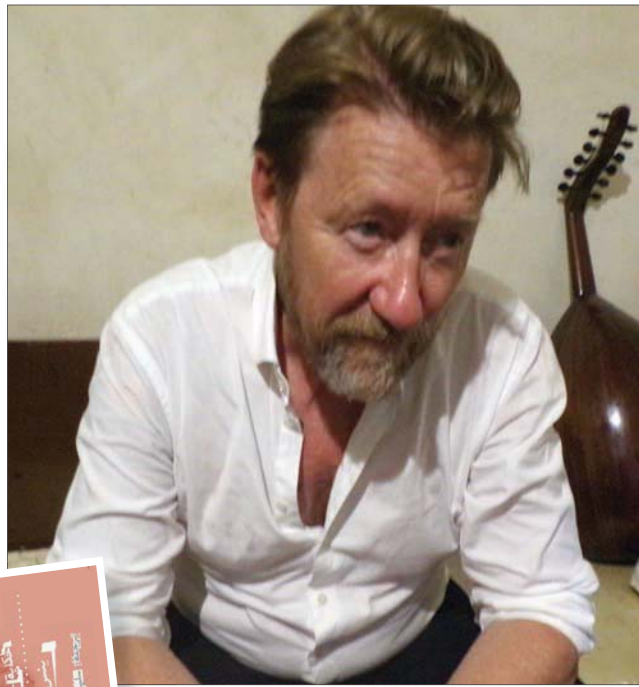
ينس مارتن إريكسن

أجعل العمل ذا رؤى وأفكار ومضامين إنسانية، وهذه هي الرواية التي كنت أسعى لكتابتها، ولم أكن أفكر في كتابة سياسية، وقد انتهت الحرب، لكن الرواية ستظل موجودة استناداً لموضوعها الإنساني. ● لكن لماذا جعلت البطل من دارسي الأب؟ - حين اخترت أن يكون بطل الرواية دارساً للأدب، كنت أريد منه أن ينتقد نفسه بعد نهاية رحلته مع القتل وانتظامه ضمن مجموعات الميليشيات التي تجند فيها، وخضع لها، وقام بتنفيذ ما تم تكليفه به، كنت أريد أن يبتدل ما جرى، والتحويلات التي حدثت له أثناء الحرب. ● تركز الرواية على عمليات القتل في حرب أهلية غير محددة الزمان ولا المكان... لماذا؟ - مجمل ما كنت أريد أن أقوله أن «شتاء عند الفجر» تعد رواية عن القتل، لكنها ليست من وجهة نظر الضحية، بل من وجهة نظر القاتل، من هنا كان سبب جعل الراوي دارساً للأدب، وقد جعلته انتهازياً، لا يريد أن يخضع لفكرة تجنيد في الجيش، ويسعى لأن ينهي هذه المرحلة وهي الجندية بطريق آخرى، وقد كانت هذه الطريق هي الانسحاب للميليشيات، التي لا تتجاوز فترة الوجود معهم أكثر من شهر، ومع ذلك فقد كانت تلك الفترة كافية لأن تحدث تدميراً كاملاً لهويته الإنسانية، والأخلاقية.