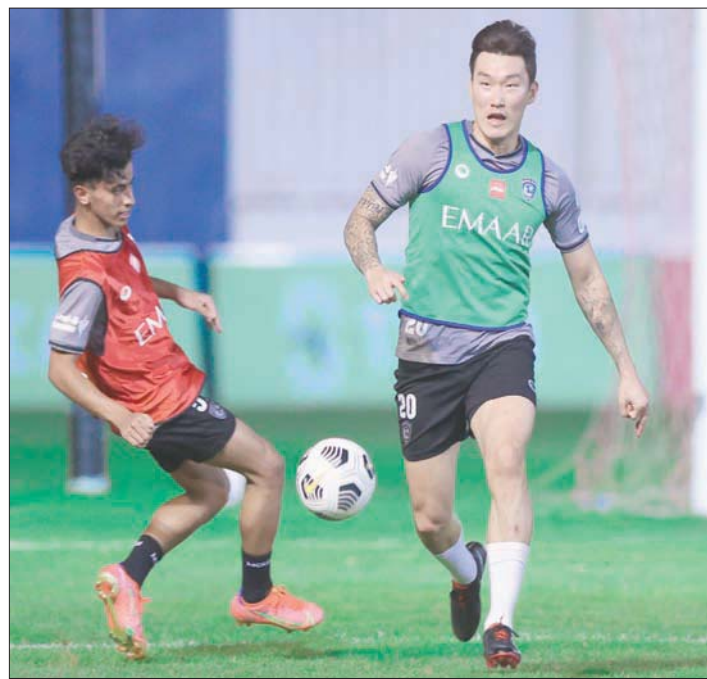
من تدريبات الهلال الأخيرة (الشرق الأوسط)

وينطلق معسكر الهلال في النمسا يوم 12 من يوليو الحالي ويمتد حتى الثاني من شهر أغسطس المقبل، وسيخوض الفريق الأزرق خلاله خمسة مباريات ودية قبل العودة مجدداً إلى العاصمة الرياض استعداداً لبدء الموسم الجديد الذي يتطلع فيه للدفاع عن لقبه الذي نجح بتحقيقه في الموسم الماضي.