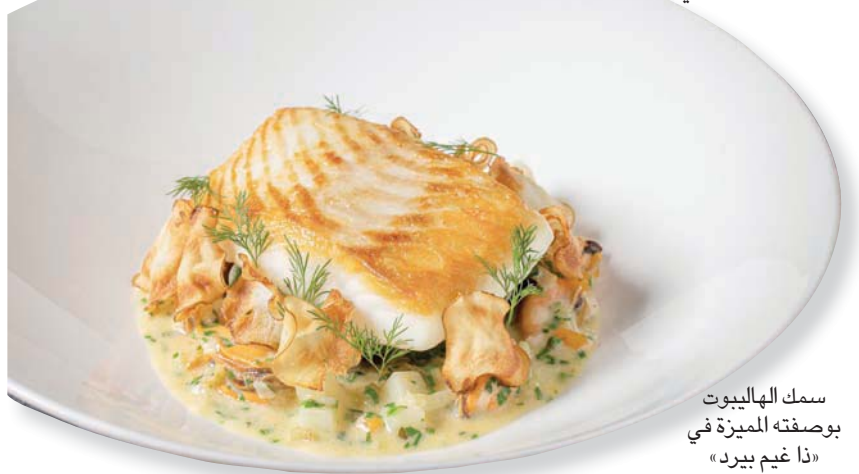
سمك الهالبيوت بوصفته المميزة في «ذا غيم بيرد»

وضع المطاعم وباقي المرافق السياحية في لندن لا يحسد عليه أصحابها الذين تواجههم مشكلات إضافية، إلى جانب خسارة الزبائن، وهي خسارة عناصر مهمة من العاملين