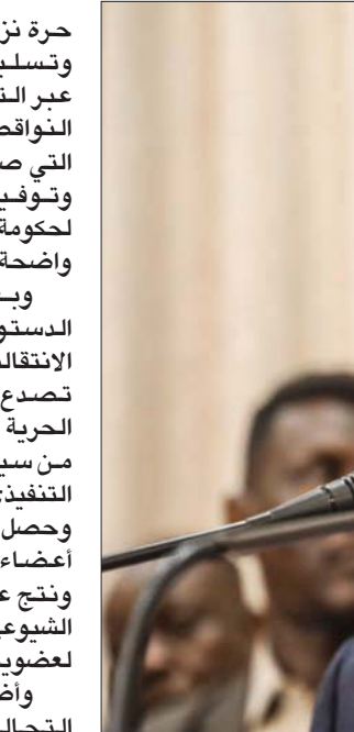
رئيس الوزراء السوداني عبد الله حمدوك

القاهرة: «الشرق الأوسط» أكد مرصد مصري أن «تنظيم داعش» الإرهابي يواصل حشد «الذئاب المنفردة» لتنفيذ عمليات إرهابية في الدول». وقال المرصد إن «الاستهداف الهوي الوطنية لدى الشباب يُعد جزءاً من (الخطاب التحريضي) للتنظيم، الذي يسعى إلى (تشويه) الواقع في أعين الشباب، وهذه هي الخطوة الأولى من سيطرته على الجهاز التنفيذي الذي كونه منفرداً، وحصل على حق تسمية ثلثي أعضاء المجلس التشريعي، ونتج عن ذلك خروج الحزب الشيوعي، وتجميد حزب الأمة لعضويته فيه». وأضعفت انقسامات التحالف الحاكم الحكومة الانتقالية، وهو ما دفع رئيس الوزراء عبد الله حمدوك إلى تقديم مبادرته الشهيرة الداعية لتوحيد قوى الثورة من جهة، ووقف التجاذبات بين المكون المدني والمكون العسكري، والتجاذبات داخل المكون المدني نفسه، وتجاذبات المكون العسكري، وعدها سبباً وحيداً لبقاء السودان أو تفرقه».