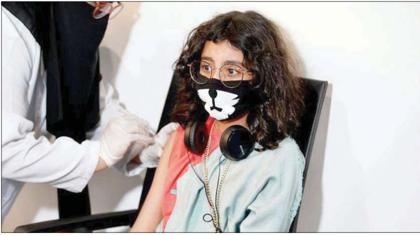
التوسع في حملة التطعيم في السعودية (واس)