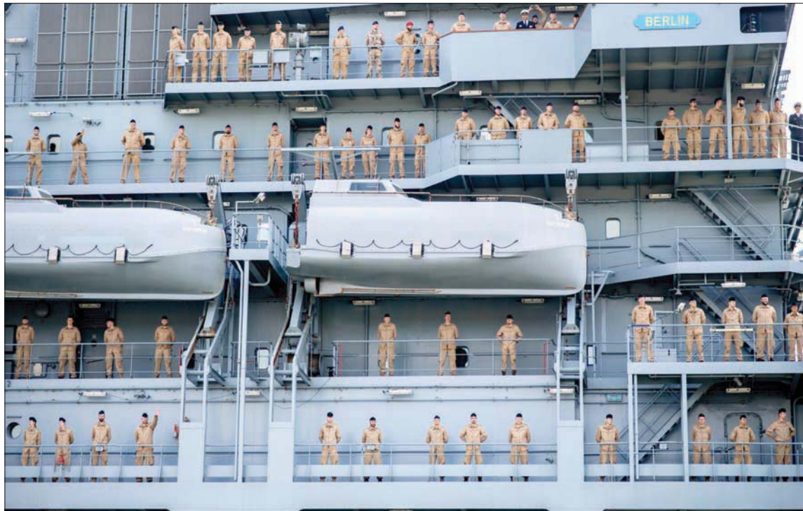
السفينة «برلين» في ميناء فيلهلمسهافن أمس السبت بعد مضي نحو أربعة شهور على مشاركتها في مهمة مراقبة الأسلحة إلى ليبيا