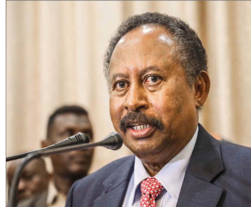
رئيس الوزراء السوداني عبد الله حمدوك

الحكومة والفترة الانتقالية، وتخدم مصالح البلاد العليا»، وأبدت القوى المتحالفة إدراكها لأهمية ما أطلقت عليه «العمل المشترك بين القوى المدنية والمكون العسكري»، وأثره على إنجاح الفترة الانتقالية للوصول إلى دولة مدنية ديمقراطية وانتخابات