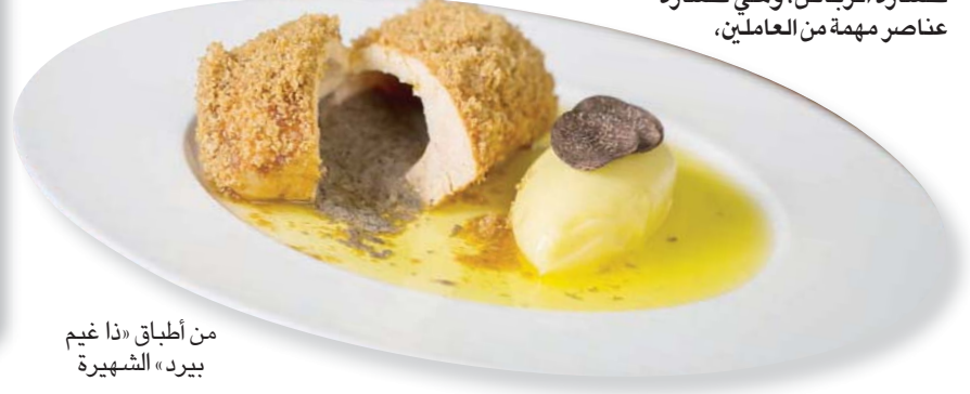
من أطباق «ذا غيم بيرد» الشهيرة