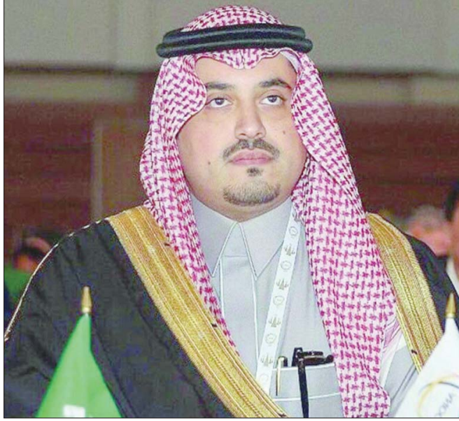
الأمير فهد بن جلوي