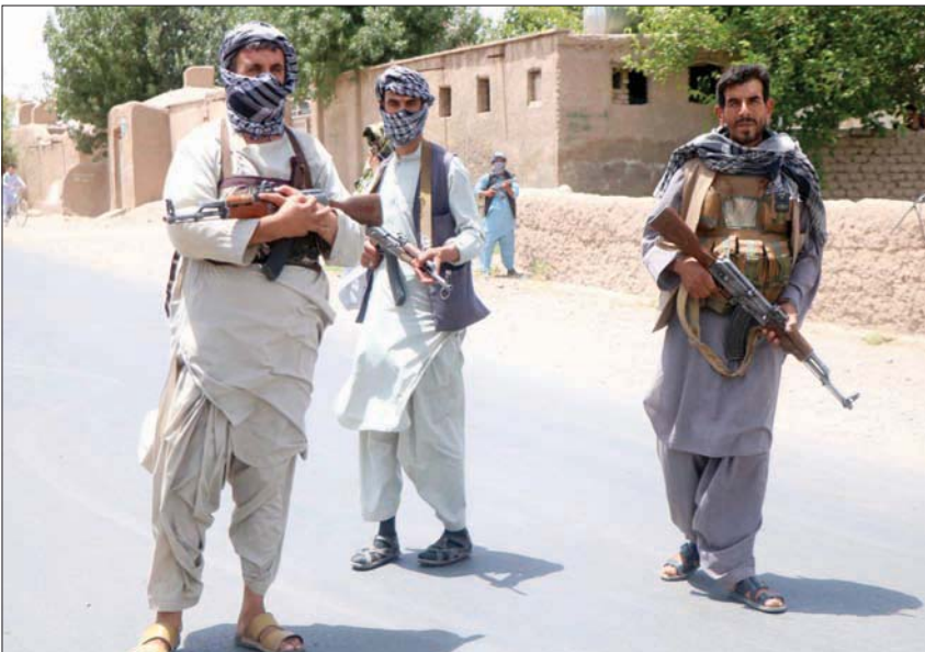
مقاتلون ينتمون إلى مجموعة إسماعيل خان يستعدون للقتال إلى جانب القوات الحكومية مع اقتراب «طالبان» من معقله في هرات

كابل، «الشرق الأوسط»، أعلنت حكومة كابل أنها تستعد لمحاولة استعادة معبر «إسلام قلعة» الواقع على الحدود الإيرانية، بعدما استولت عليه حركة «طالبان» يوم الخميس، وجاء ذلك في وقت بدأت هذه الحركة التقدم نحو مدينة قندهار، معقلها السابق في جنوب أفغانستان.