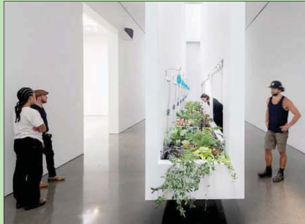
معرض أميركي يسمح بأكل المعروضات