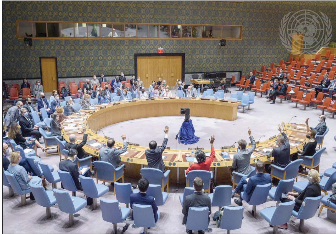
ممثلو الدول الأعضاء في مجلس الأمن يصوتون لصالح آلية دولية لإيصال المساعدات إلى سوريا مساء أول من أمس (الأمم المتحدة)

بالقرار رغم التنازلات الكبيرة من قبلها، تعكس رغبة باستئناف الحوار السياسي بينهما حول سوريا وغيرها والاستعداد لقبول «السقف الروسي»، خصوصاً أن بايدن قال ليوتين في جنيف إن تمديد القرار «حيوي» للتعاون، ما فُسر على أنه «شرط لاستئناف الحوار» الذي قد يشمل الوجود العسكري الأميركي شرق الفرات، والحوار بين الأكراد ودمشق، ومحاربة الإرهاب، ووقف نار شاملاً في سوريا، وتنفيذاً مرناً للقرار 2254.