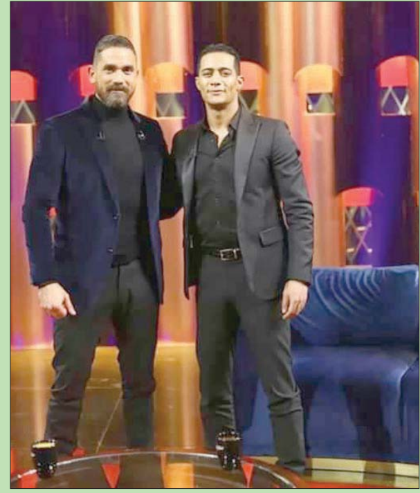
لقطة من برنامج «سهراتين» لأمير كراترة