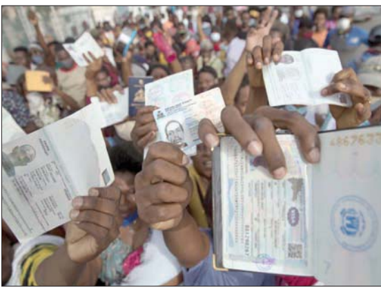
المنات يتوافدون على السفارة الأمريكية في هايتي للحصول على تأشيرات لمغادرة بلادهم بعد اغتيال الرئيس (إ.ب.أ)

هايتي طلبت مساعدة أمنية، وأخرى في مجال التحقيقات، وقال إن البنتاغون سيبقي على اتصال منظم مع المسؤولين في هايتي لبحث كيف يمكن للولايات المتحدة أن تساعد في هذا الصدد. وبعد شلل دام لأيام، استأققت بور أو برنس وضواحيها على هدوء حذر فحش، وفق ما أفاد به مراسل الصحافة الفرنسية. وعادت وسائل النقل العام والبنوك ومحطات الوقود والمحال الإدارات العامة إلى طبيعتها، وأوضح الوزير لـ«رويترز»: «إننا في موقف نعقد فيه أن البنية التحتية للبلاد (الميناء والمطار الأميركيين على المستوى الدولي، كذا ملاحقة أشخاص في قضايا الإرهاب والتطرف، كما أنه يأتي توتوياً للأنحراط الجدي والفعال للمصالح الأمنية المغربية في الجهود الدولية لمواجهة الخطر الإرهابي. وخلص البيان إلى أنه يجري حالياً التنسيق مع المكتب المركزي الوطني التابع للمديرية (مكتب إنتربول الرباط) والسلطات القضائية المغربية ونظيرتها الإيطالية، وذلك للتسريع بإرسال ملف التسليم الخاص بالمعني بالأمر عبر القنوات الرسمية المختصة».