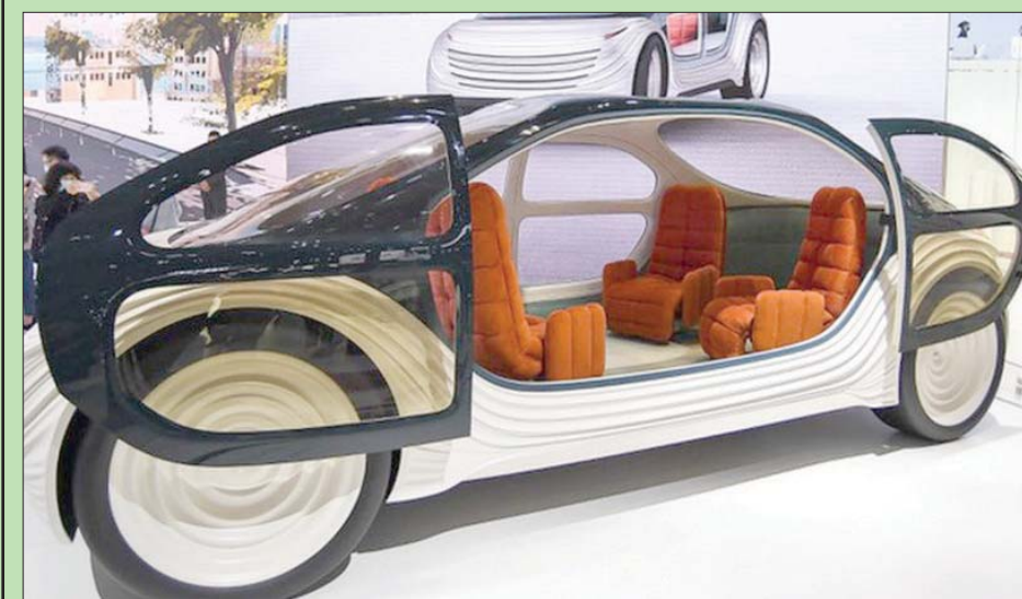
سيارة مصممة لسحب التلوث من الهواء

قيم التصميم تظهر من خلال السيارات، سواء كانت فورد سيبيرا في عام 1980، أو فيات باندا. حيث ظهرت بعض الأفكار الرئيسية من خلال تصاميم السيارات. وعندما اتصلت بنا شركة «أي إم موتورز» في الصين، قلنا إننا لسنا مصممي سيارات، فكان ردهم: لهذا السبب نريدك، وللسيارة - التي كشف عنها للمرة الأولى في معرض شنغهاي للسيارات في شهر أبريل (نيسان) - سقف زجاجي كبير، أما في الداخل فتبدو وكأنها غرفة، بمقاعد قابلة للطي يمكن تحويلها إلى أسرة، وطاولة مركزية مخصصة للاجتماعات أو تناول الوجبات. ومقود السيارة مخفي في لوحة القيادة والجزء الخارجي منسوج بسلسلة من التمجوجات أو التواءات. وقال السيد هيدزرويك: «إن مصنعي السيارات يسابقون أنفسهم من أجل صناعة السيارات الكهربائية، ولكن السيارة الكهربائية الجديدة لا ينبغي أن تكون مجرد سيارة أخرى ذات مظهر مختلف».