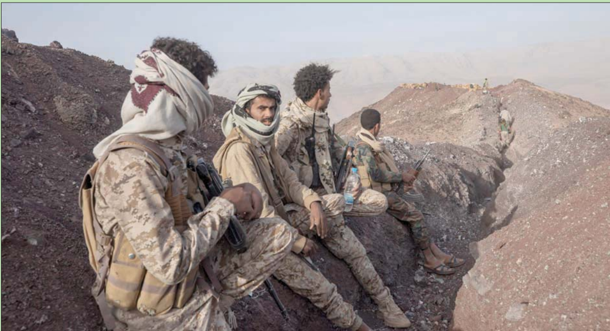
مقاتلون من الجيش اليمني في إحدى جبهات مارب (سبأ)

لا يشكلون حاضنة فعلية للمليشيات الحوثية، ما عدا بعض المديرية التي تحظى فيها الجماعة بإسناد قائم على الانتماء السلافي لرُعيم الجماعة، وذلك يعني أن الكتلة السكانية في أغلبها ستتحول إلى حاضنة شعبية لإسناد القوات الشرعية، ما سيسهل أي تحركات عسكرية باتجاه دمار المجاورة التي تعد واحدة من المناطق التي يعتمد عليها الحوثيون في استقطاب المجندين الجدد.