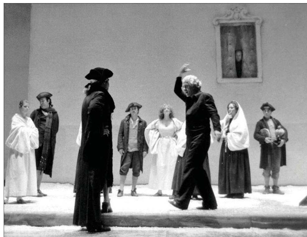
من أعماله المسرحية

كما يشاركني بهذا الرأي العديد من النقاد والكتاب في جميع أنحاء العالم، ذلك أن هذا العمل يعالج أسئلة إنسانية دائمة الحضور؛ فهو يناقش بجدلية مأساة البحث عن الحرية والتوزع بين الذكرى والأمل في مستقبل الإنسان الجديد، كما أن «فاوست» لعبت دوراً مهماً في المهينة الفكرية للنظرية المادية في ألمانيا. إنها إذ تمثل النقطة العظيمة التي اكتنزت بها حياة غوته الذي كان يكرر مقولته الشهيرة (الجدير بالحرية كما بالحياة هو فقط من ينتزعها كل يوم).