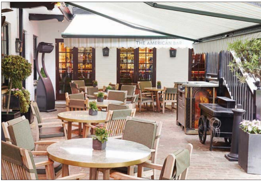
فتح الباحات الخارجية لدى بعض المطاعم ساعدها على مواصلة العمل

ويعد إقفال الفنادق على مدى أشهر طويلة، عادت لتفتح أبوابها من جديد، ولكن بنسبة خجولة لا تتعدى العشرين في المائة. وانقسام آراء الشعب حول رفع القيود ملحوظ، ولكنه أمر لا بد منه. وهذا ما أكدته بروكتر الذي يرى أن عودة حركة الطيران إلى ما كانت عليه قبل الجائحة سيعيد الحياة إلى العاصمة لندن ومرافقها السياحية، ولا يوجد حل إلا من خلال إلغاء قوانين الحجر للقادمين من الخارج، ومن المنتظر أن يلغي هذا القانون في أغسطس (آب) المقبل. وتبقى هناك ذيول خروج إنجلترا من الاتحاد الأوروبي الذي أدى إلى خسارة مهرات كثيرة، ولن يساعد على تعويضها إلا تسهيل الحصول على تأشيرات العمل، والسماح للطهاة والعاملين في قطاع الضيافة بالعودة والعمل في لندن من جديد.