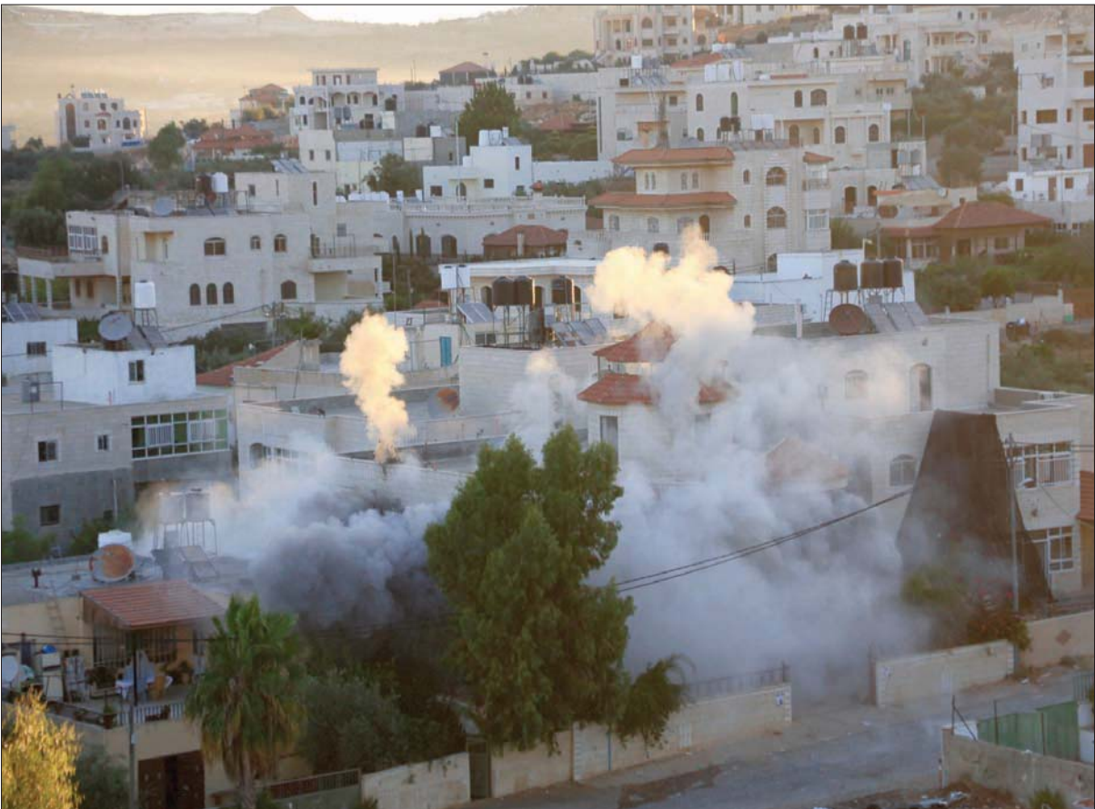
هدم منزل أسرة فلسطينية قرب رام الله في الضفة الغربية

الاحتلال هدمت ما لا يقل عن 421 مبنى يملكها فلسطينيون منذ بداية العام الحالي، بما فيها 130 مبنى موله المانحون، فيما اعتبرت اللجنة الدولية للصليب الأحمر هدم الجيش الإسرائيلي قرية حفصة الفوقا شمال الضفة الغربية «تقويضاً للكرامة الإنسانية». كما أكد الاتحاد الأوروبي أن سياسة الاستيطان الإسرائيلية غير قانونية بموجب القانون الدولي، وكذلك الإجراءات أحادية الجانب عمليات النقل القسري والإخلاء وهدم ومصادرة المنازل، التي لن تؤدي إلا إلى بيئة متوترة بالفعل ومزيد من العنف والمعاناة الإنسانية.