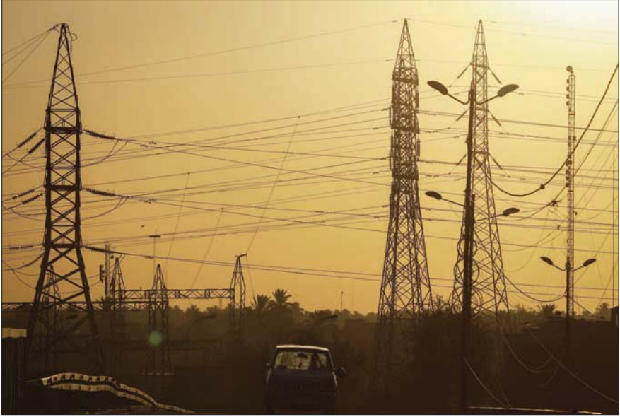
المحطة الرئيسية لتوليد الكهرباء في بغداد

الثاني المهيمن على سلم الاهتمامات، وفي وسائل الإعلام التقليدية، أو في «السوشيال ميديا». ومن بين المساعي التي حاولت الحكومة العراقية اللجوء إليها بعد حصر الملف بيد الكاظمي، تخصيص مبلغ قدره 50 مليار دينار عراقي (بحدود 45 مليون دولار أميركي) بهدف إصلاح أبراج الطاقة التي تم استهدافها من قبل أعداء مجهولين، من عدا متهمها واحداً، بل هو الأوحده، وهو تنظيم «داعش». ومع أن التنظيم لم يتبن أباً من تلك الاستهدافات، بينما هو في تلك بيتني، بل ويفتخر بما هي عملية يقوم بها، بما في ذلك عمليات القتل أو الحرق الجماعي، فإن الاتهامات طالت ماقيات فساده وجاهت سياسية بدأت مع اقتراب موسم الانتخابات الاستفشار في ملف الكهرباء، لئلا يسير على طريق إصلاح الخلل المتهاككة أصلا بسبب الفساد وسوء التخطيط وسوء الإدارة، فضلاً عن غياب الإرادة السياسية، بل على تحريك إطفاء ألسنة اللهب، تخمك مستورد، لكي يبقى العراق يستورد كل شيء، وأوله الكهرباء، مع إنه من الناحية العملية قادر على الإنتاج والتصدير معاً.