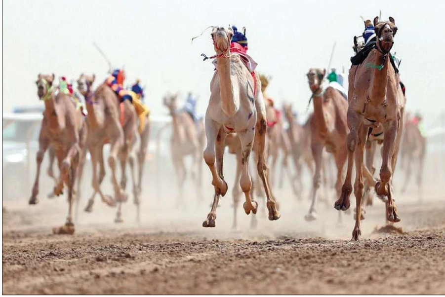
مهرجان ولي العهد للهجن سينطلق مطلع أغسطس المقبل في الطائف (الشرق الأوسط)