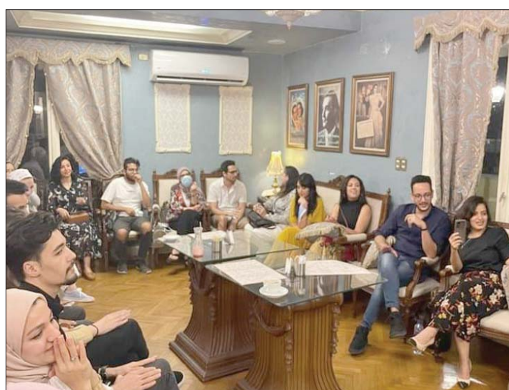
سهرات العود في أجواء عائلية بمطعم «الفيلا»