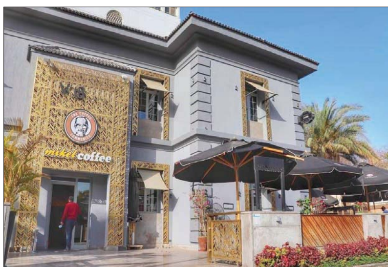
مطعم mikel في مصر الجديدة