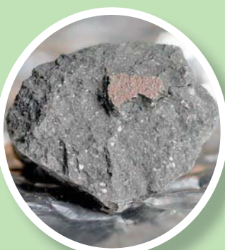
إحدى شظايا نيزك وينشكوم (متحف التاريخ الطبيعي)

في بلدنا، ويعطيان فرصة فريدة لاكتشاف أصول المياه والحياة على الأرض». وتم تعقب هذا النيزك باستخدام الصور ولقطات الفيديو من تحالف (فايربول) البريطاني، الذي يموله مجلس منظمات العلوم والتكنولوجيا، ثم تم تحديد مكان الشظايا بسرعة واستعادتها، ومنذ الاكتشاف، أجرى علماء المملكة المتحدة دراسات أولية على النيزك لفهم كيفية تشكل النظام الشمسي. مثل الأرض».