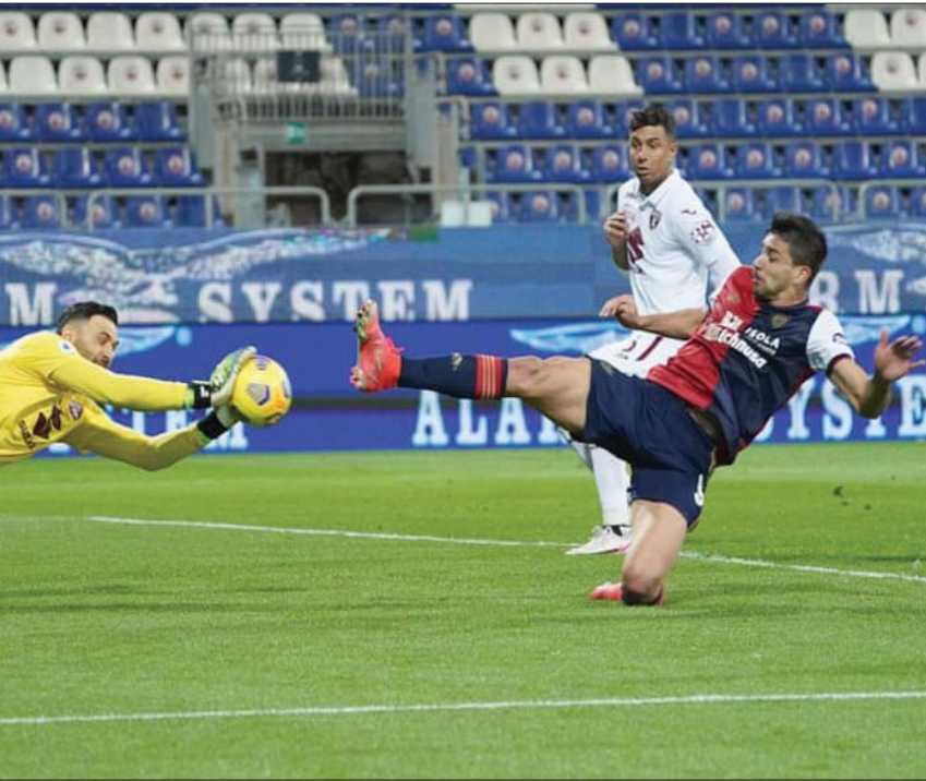
جيوفاني سيميوني أثناء محاولة لهز شبك تورينو في فبراير الماضي (أب)

ويضيف: «عندما أنتهي من التدريبات اليومية يخرج العامل المسؤول عن جميع تعليقات اللاعبين ويسألني عما إذا كنت سأنهب، فأقول له لا سابقياً هنا فهذا هو المكان الذي أشعر فيه بالمتعة وهو المكان الذي أريد أن أكون به دائماً. لم يتبق في مسيرتي الكروية سوى عشر سنوات فقط، لأنني عندما سأصل إلى الخامسة والثلاثين من عمري سأتوقف عن اللعب، لذلك دعوني أستمتع باللعب الآن».