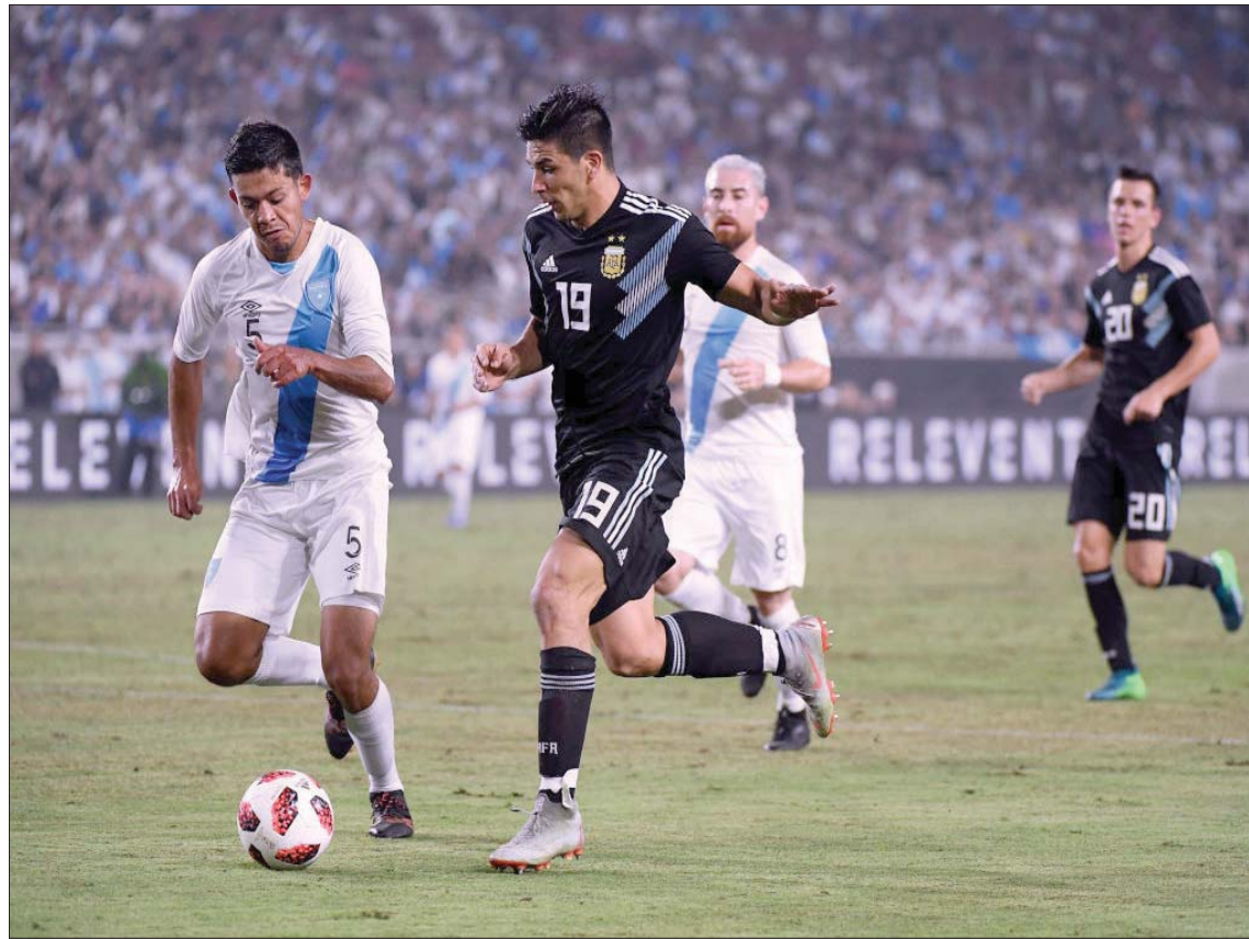
جيوفاني سيميوني يسجل أول هدف له مع المنتخب الأرجنتيني في شبك غواتيمالا عام 2018

يقول جيوفاني: «ما زلت أحتفظ بصورة هذا الفريق في بوينس آيرس. كنت أريد أن أكون في خط الوسط مثل والدي، لكنه رفض وطلب مني أن أكون في المقدمة؛ أسد الكرة بكل قوة. كان حراس المرمى صغاراً وكان المرمى واسعاً، وكان يصرخ في دائما ويقول: سدد، سدد»، ويضيف: «عندنا إلى الأرجنتين، لكنني كنت أفكر دائماً في العودة إلى أوروبا. لقد ولدت في بوينس آيرس، لكنني كنت أشعر كأنني أوروبي. ومع مرور الوقت، أدركت أن الأرجنتين هي وطني، لكنني كنت أشعر في داخلي بأن أوروبا قريبة للغاية من قلبي. الأمر لا يتعلق فقط بكرة القدم، لكن الحياة التي عشتها هناك جعلتني أوروبياً وأميركياً