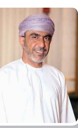
الشيخ سالم الوهيبي

الأندية كدعامة أساسية وعملية للارتقاء بعناصر المنظومة الكروية العمانية إلى أعلى المعايير الدولية في إطار خطة زمنية محددة. وهو أمر يستدعي تطوير كرة القدم ووضع الخطط لدعم جوانب القوة ومعالجة القصور في أنظمة الاحتراف المحلية، واختيار النموذج الأكثر ملاءمة لخصوصية الأندية العمانية. كيف ترى التنسيق بين الاتحادين السعودي والعماني على كافة الأصعدة، سواء الخليجية أو القارية والدولية في مجال الرياضة بشكل عام وكرة القدم؟ - كما ذكرت سابقاً، العلاقة بين الاتحادين السعودي والعماني هي علاقة متميزة ومتينة تعكس عمق