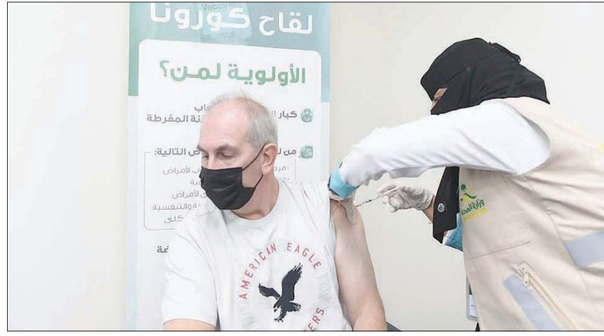
الرياض، الشرق الأوسط،

تبدأ السعودية إجراءات استيراد لقاح «موديرنا» الذي تمت الموافقة عليه من قبل الهيئة العامة للغذاء والدواء بعد التأكد من مأمونية اللقاح وفعاليتها في الوقت الذي تجاوز عدد الجرعات الموزعة من لقاح كورونا في المملكة أكثر من 19 مليون جرعة عبر أكثر من 587 مركزاً موزعة في عموم البلاد.