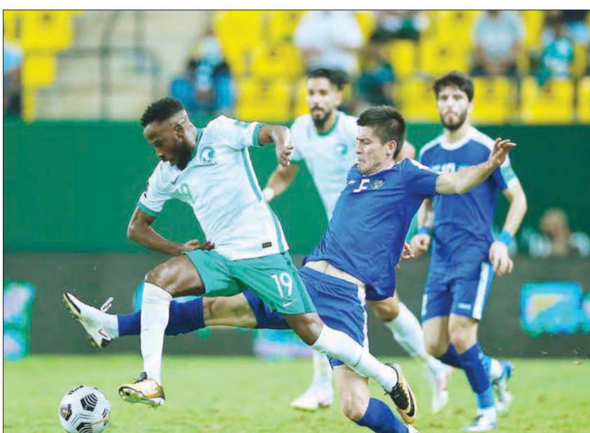
مهمة صعبة تنتظر الأخضر في تصفيات آسيا الموندiale (الشرق الأوسط)

يختم التصفيات بمواجهتين أمام الصين وأستراليا يومي 24 و29 من مارس (آذار) المقبل.