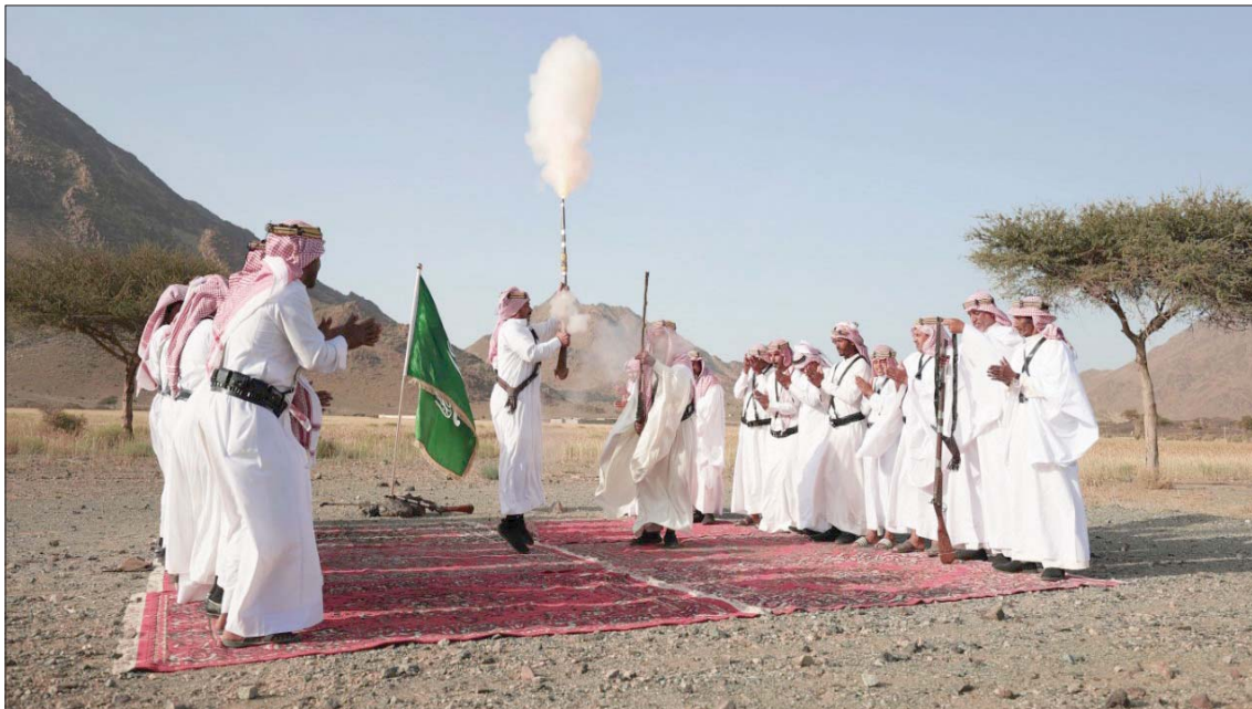
الفنون الشعبية أبرز الحكايا الجاذبة التي تعزز المشاركة والجذب السياحي (الشرق الأوسط)

إلى نحو أبعد من الاقتصاد، وما سيعززها أيضاً؛ تظل حكاية الإنسان أكبر عناصر الإثراء للرحلة السياحية في معظم دول العالم، ذلك النهج أخذ حيزه ليحكي عمق التجربة ضمن أحد أكبر مشروعات السعودية التطويرية على ساحل البحر الأحمر.