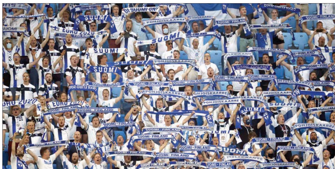
مشجعو فنلندا في ملعب سان بطرسبرغ في 21 يونيو الماضي

ورصدت مئات الحالات لدى المشجعين في مباريات كأس أوروبا؛ خصوصاً لدى الأسكوتلنديين العائدين من لندن أو الفنلنديين العائدين من سان بطرسبرغ أو مشجعين في ملعب كوبنهاغن حين تبن مصابون بالمرض. وأكدت سمالوود أن «ما يجب أن ننظر إليه حول اللاعب هو كيف يصل الناس إلى هناك، هل يتحركون في قوافل حافلات مزدحمة أم أنهم يطبقون إجراءات فردية؟». وأضافت أن