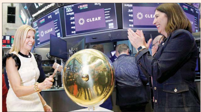
بدأ المؤشر «ستاندرد أند بورز 500» النصف الثاني من العام عند مستويات قياسية (رويترز)

المؤشر داكس الألماني 0,6 في المائة بعد أن أظهرت بيانات أن مبيعات التجزئة أكبر اقتصاد في أوروبا انتعشت في مايو (أيار). لكن على عكس الأسواق الأوروبية والأمريكية، أغلقت الأسهم اليابانية على انخفاض الخميس، إذ تعرضت لضغوط جراء مخاوف من أن يؤدي ارتفاع الإصابات بكوفيد - 19 إلى تمديد قيود وإبطاء التعافي الاقتصادي. ونزل المؤشر بنكي 0,29 في المائة إلى 28707,04 نقطة، بينما تراجع المؤشر تويكس الأوسع نطاقاً 0,22 في المائة إلى 1939,21 نقطة.