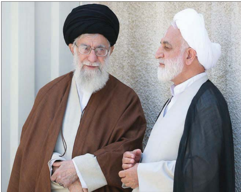
صورة نشرها موقع المرشد الإيراني علي خامنئي بعد تكليفه محسن إجنئي برئاسة القضاء أمس

وقبل أيام من تسمية رئيس للقضاء أطلق إجنئي حساباً على شبكة «إنستغرام»، وهو ما عُدّ مؤشراً آخر على توليه منصب