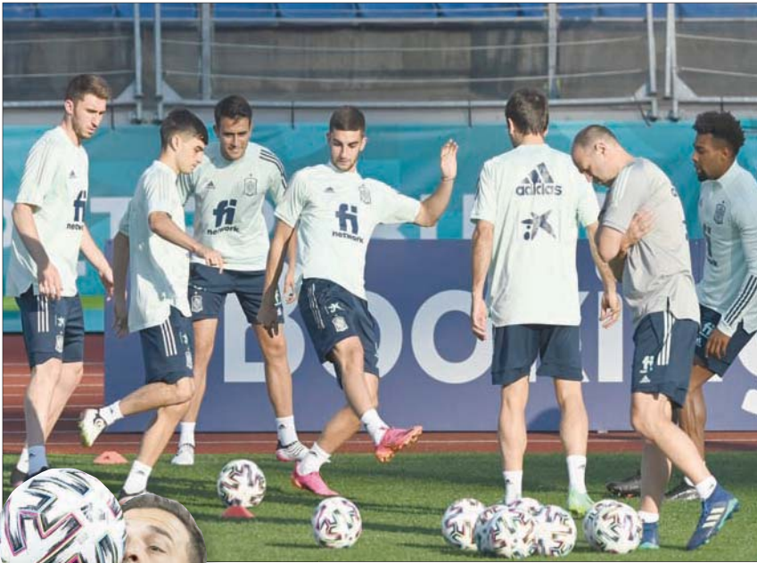
لاعبو إسبانيا يتطلعون لمواصلة عرضهم الهجومية

ستكون «كأس أوروبا» على موعد مع مباراة قمة بين بلجيكا وإيطاليا في ربع النهائي اليوم الذي يشهد لقاء آخر ساجناً بين إسبانيا وسويسرا.