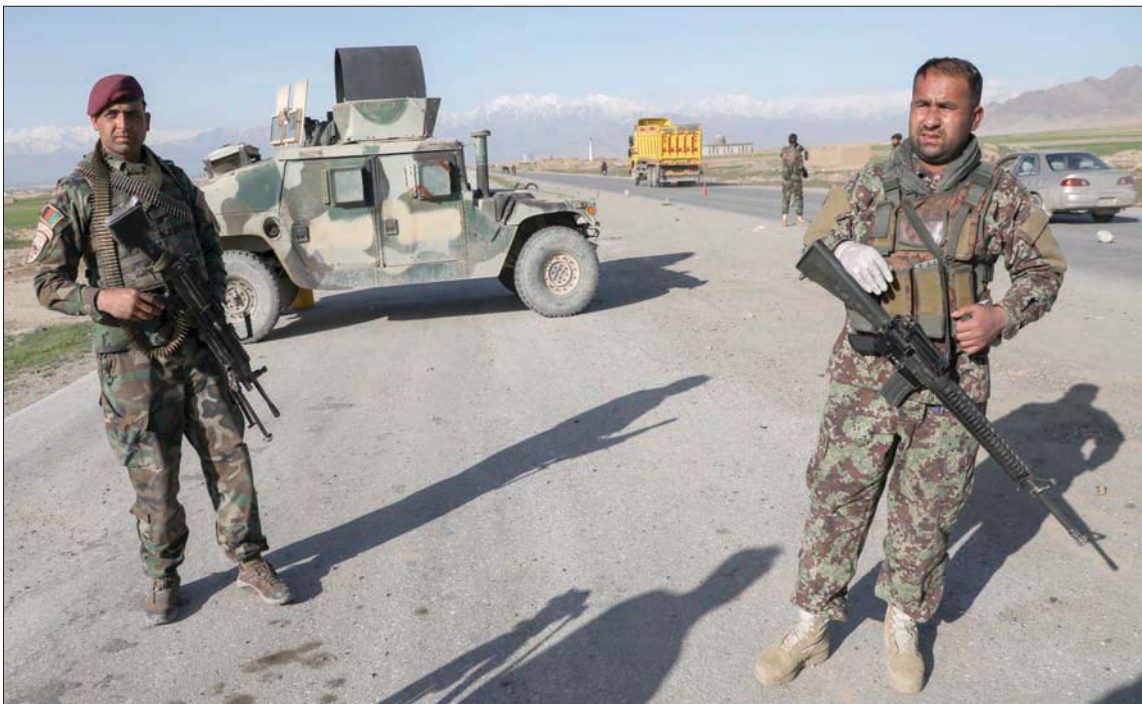
استنفاً أمني لقوات أفغانية خارج قاعدة باغرام في محيط العاصمة كابل أمس

نفسه هو كيف تستطيع الولايات المتحدة، في ظل مثل هذه القيود، أن تحمي مصالحها الحيوية. وكما أشار أحد كبار القادة