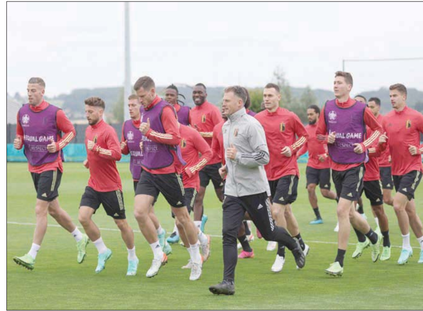
لاعبو بلجيكا خلال التدريب من دون هازارد ودي برون قبل مواجهة إيطاليا