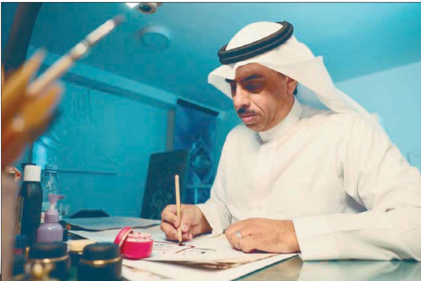
إبراز مختلف الفنون ضمن حكايا الناس في البحر الأحمر (الشرق الأوسط)

وُدّشت شركة البحر الأحمر للتطوير في عام 2018، المملكة بالكامل لصندوق الاستثمارات العامة السعودي، الذي يهدف إلى وضع المملكة على خريطة السياحة العالمية، ويخلق فرص استكشاف وجهة تتميز مع معايير منافسية سياحية، بما يضم من أرخبيل يحتوي على أكثر من 90 جزيرة، ويسعى خلال العامين المقبلين لافتتاح مرحلته الأولى، التي ستشكل إضافة نوعية في تطوير الساحل البحري الأطول عربياً.