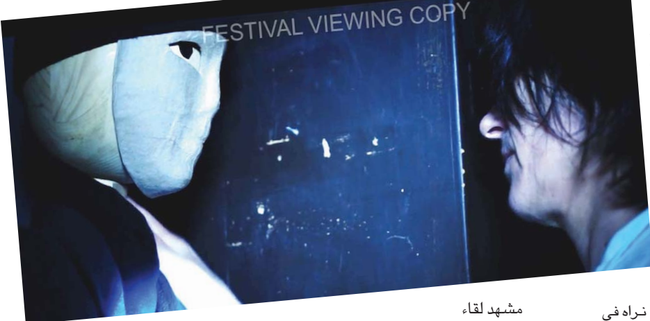
مشهد لقاء من فيلم «الرجل الخشب»

● ثم ها هو موضوع «سينما المرأة» الذي كنا نحدثنا عنه هنا أكثر من مرة. هناك مهرجان جرى عقده في مدينة أسوان متخصص في سينما المرأة. عظيم. أنا مع منجها كل ما نستحقه من تقدير، لكن ما هي سينما المرأة بالتحديد؟ كيف ننقد ملامح هذه السينما؟ وهل هناك سينما رجالية وأخرى ولاية كما محلات الملائس؟ ● المسألة تدخل في نطاق موجة احتفاء كبير بالمرأة فالمهرجانات باتت تخصص عدداً من الأفلام المشتركة من إخراج نساء وتنتهي أن نصف أعضاء لجنة التحكيم (أو أكثر من النساء). هذا خطأ كيفما نظرنا إليه