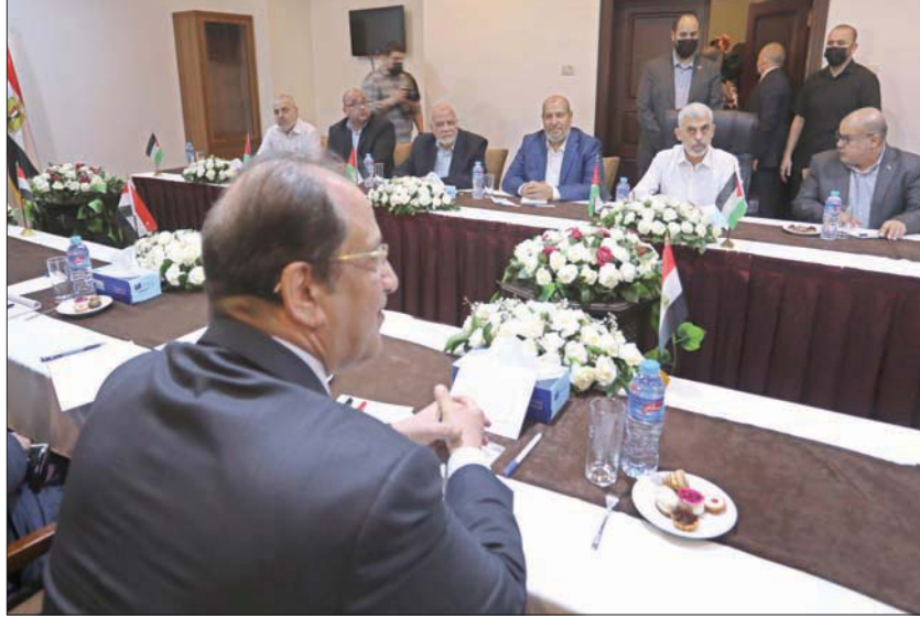
لقاء قادة «حماس» في غزة مع الوفد المصري بحضور رئيس المخابرات المصرية عباس كامل مايو الماضي

يقومون في نفس المبنى. وأمام الجمهور المؤقت، من المتوقع انعقاد جلسة مجلس الوزراء الإسرائيلي السياسي والأمني المصغر «الكابنيت»، خلال الأسابيع المقبلة، لمناقشة ما إذا كان سيتم التنازل لـ«حماس» في قضية صفقة تبادل الأسرى. ووفقاً للموقع، تشير تقديرات مؤسسة الأمن إلى أن مجلس الوزراء الأمني سيطلب الانعقاد واتخاذ قرار بشأن ما إذا كان، بناءً على موقف «حماس»، سيتم التنازل وتقديم صفقة تشمل إطلاق سراح أسرى قتلا إسرائيليين، أو الاستمرار في سياسة الحكومة السابقة المتمثلة بمقاومة الأسرى في غزة بالإعمار والمشاريع والهدنة الطويلة.