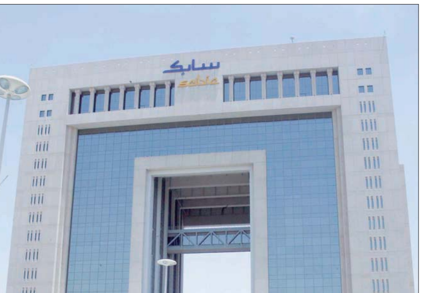
«سابك» السعودية تحقق أفضل ممارسة عالمية في الاقتصاد الدائري للبلاستيك (الشرق الأوسط)

جروب»، أمس، إن إيرادات الخدمات المصرفية الاستثمارية والموجهة للشركات لنشاطها الهندسية وحلول الأسواق في السعودية «زادت إلى ثلاثة أضعاف تقريباً» منذ العودة إلى المملكة في 2018 بترخيص من هيئة السوق المالية، بعد غياب دام 13 عاماً. وأضاف: «بين الأسواق الناشئة وباعتبارها اقتصاداً ضمن مجموعة العشرين، فإن الشركة من نهج الاقتصاد الخطي إلى الاقتصاد الدائري»، مشيراً إلى التعاون مع مجموعة واسعة من الشركاء على مستوى العالم عبر سلسلة القيمة، سعيًا إلى تحقيق رؤيتها الخاصة بإتمام دورة التعامل من النفايات البلاستيكية والتحرك نحو مستقبل دائري مستدام. وفي محور آخر، قال مسؤول تنفيذي كبير لدى «سيتي»