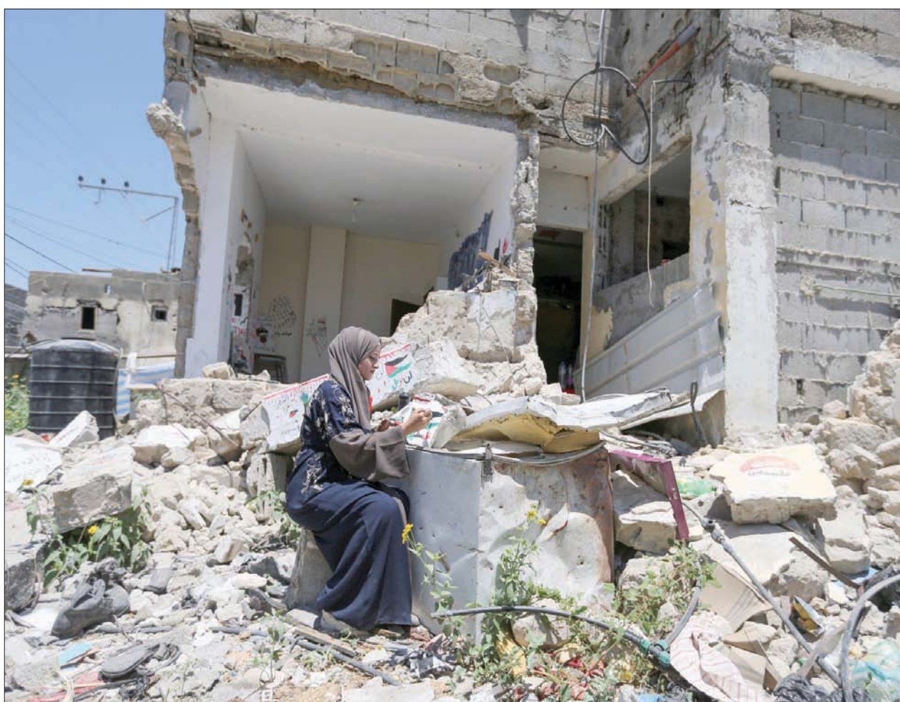
فلسطينية ترسم على ركام بيتها الذي دمره القصف الإسرائيلي في رفح

لكن «فتح» تريد أن تبدأ بتشكيل حكومة وحدة وطنية، من أجل توحيد المؤسسات الفلسطينية والعمل، فوراً، على إعادة إعمار قطاع غزة باعتبار أن ذلك المسألة الأكثر إلحاحاً في هذا الوقت. هذا، ويوجد خلاف آخر بين «فتح» و«حماس»، يدور حول موضوع الإعمار والبيئة والجهة المسؤولة عنه.