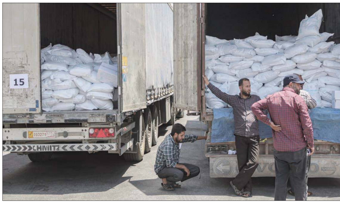
مساعدات إنسانية من منظمة الغذاء العالمي إلى شمال سوريا عبر معبر باب الهوى (د.ب.أ)

وكشف الدبلوماسي عما وصفه «مبادرة جديدة» قد يطلقها اجتماع أستانة المقبل بتعلق بملف المساعدات الإنسانية وتمحور حول إعلان استعداد المجموعة لإيجاد الصيغ المناسبة لترتيب دخول المساعدات الإنسانية بالتعاون مع دمشق. وقال، إن أولويات الاجتماع المقبل سوف تركز على هذه النقطة مع الملفات المطروحة أساساً على أجدد «ضامني وقف النار وهي «تثبيت التهدئة ووضع اليات محددة لتنفيذ القرارات السابقة حول دلب بما فيها تكريس المنطقة منزوعة السلاح وسحب أسلحة المقاتلين الثقيلة وفتح