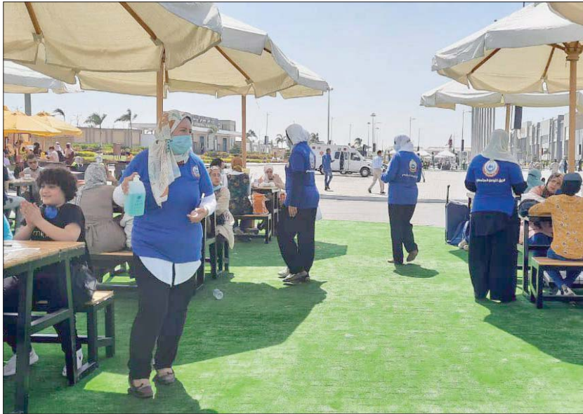
بدء تطبيق الإجراءات الاحترازية في معرض القاهرة للكتاب

حتى مساء أول من أمس، هو 281282 من ضمنهم 211384 حالة تم شفاؤها، و 16169 حالة وفاة». وتشير «الصحّة» إلى «خروج 579 متعافيا من فيروس (كورونا) من المستشفيات، وذلك بعد تلقيهم الرعاية الطبية اللازمة وتام شفائهم وفقاً لإرشادات منظمة الصحة العالمية، ليرتفع إجمالي المتعافين من الفيروس إلى 211384 حتى مساء (الأربعاء) الماضي». من جهته، أكد مستشار الرئيس المصري لشؤون الصحة، محمد عوض تاج الدين، أن «القيادة السياسية في مصر تقوم بجهود كبيرة من أجل الحصول على لقاح (كورونا)، والعمل على تصنيعه محلياً من أجل الشعب المصري وحمايته»، معلناً في تصريحات متلفزة مساء أول من أمس عن الاتفاق والتعاقد على 26 مليون