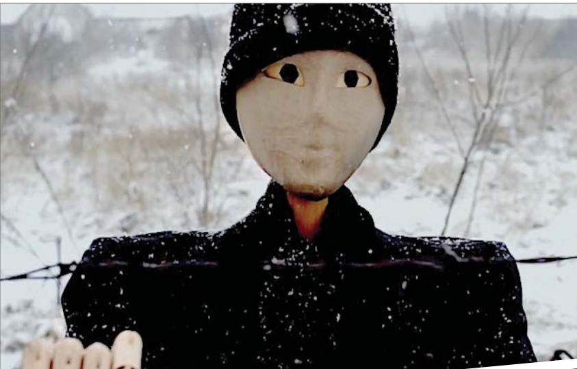
«الرجل الخشب» هارب من الأيام

ركزت أكثر على اللقطات القريبة لخلق التعاطف والتفاعل معه. تصادقت مع الرجل الخشب وأصبح جزءاً مني وكذلك طاقم التصوير الصغير بدءاً من التعاطف والتفاعل مع رجل الخشب والذي أصبح جزءاً منّا. وهذا وجدت مونتير بريطاني صديق قديم (هيو ويليامز) وطلبت منه مشاهدة المونتاج الأولي. عندما شاهد النسخة الأولى قال لي أود أن أعمل الفيلم. سألته لماذا فاجاب لانك أنجزت شيئاً غير مطروق وطريقة تصويرك لدمية من خشب أذهلتني.