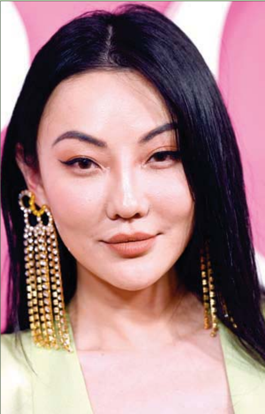
المثلة الأميركية جيسكا وانغ لدى حضورها العرض الأول للمسلسل التلفزيوني الجديد «فتاة القيل والقال» في نيويورك