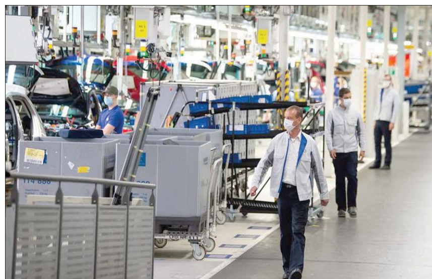
دفع ارتفاع الطلب إلى نمو أنشطة مصانع اليورو بمعدل غير مسبوق

مخزوناتاتها. وفي مواجهة ذلك، تستعين المصانع بعملية إضافية وتكتف الاستثمار لزيادة الإنتاج، وانخفض معدل البطالة بين الشباب دون سن 25 عاماً إلى 17,5 في المائة مقابل 18,4 في المائة في أبريل. وأظهرت البيانات أن معدل البطالة في الاتحاد الأوروبي ككل بلغ 7,3 في المائة في مايو، مقابل 7,4 في المائة في أبريل.