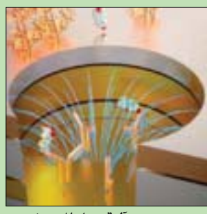
رسم يوضح آلية عمل المستشعر (الفريق البحثي)

منخفضة، وتحققوا في الدراسة المشهورة أول من أمس في دورية «ساينس أدفانسيس»، من صحة أداء الجهاز المصغر على 65 عينة دم من مرضى التهاب المفاصل الروماتويدي. ويوظف الكورتيزول هرمونات التوتر الأخرى العديد من جوانب صحتنا الجسدية والعقلية، بما في ذلك نوعية النوم، ويمكن أن تؤدي المستويات العالية من الكورتيزول إلى قلة النوم، مما يزيد من التوتر الذي يمكن أن يساهم في نوبات القلب والنوبات القلبية وأمراض أخرى.