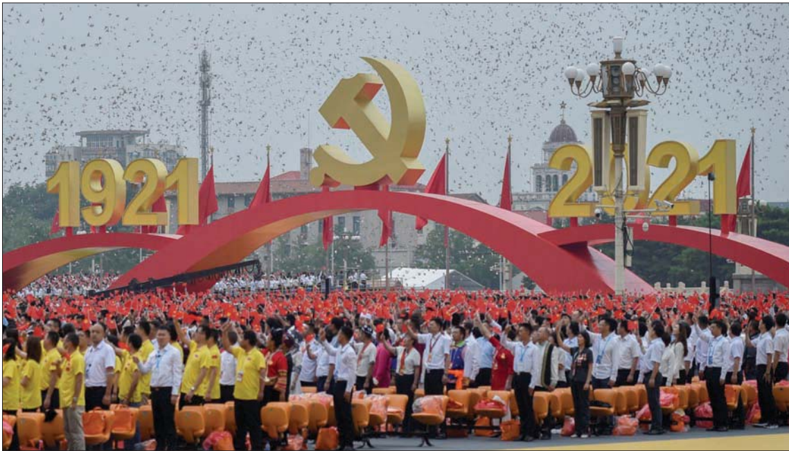
من احتفالات الصين أمس بمئوية الحزب الشيوعي الحاكم

وفي عامه المائة، قدم الحزب نسخة انتقافية من التاريخ من خلال الأقسام والحملات وكتب «السياسة الحمراء» التي تتجاهل العنف الجماعي لـ«الثورة الثقافية» والمجاعات وقمع الطلاب في ميدان تيانانمن». وهناك قضايا أخرى تذكّر بالمخاطر على الاستقرار؛ إذ تصادف الخميس أيضاً الذكرى السنوية الرابعة والعشرين لتسليم هونغ كونغ؛ المستعمرة البريطانية السابقة، إلى بكين، وهو التاريخ الذي قوبل حينها بمظاهرات معارضة حاشدة. وقبل عام من اليوم، فرضت الصين قانوناً صارماً لأن لامن القومي على المدينة رداً على احتجاجات ضخمة غلب عليها الغضب، وبموجب القانون؛ وُجّهت اتهامات للناشطين وجرّمت الشعارات المناهضة للصين، وحتى أغلقت صحيفة معارضة، في وقت يغرق فيه القانون المدني؛ التي كانت تحظى في الماضي بحريات لا مثيل لها في البر الرئيسي، في حالة «طوارئ» فيما يتعلق بحقوق الإنسان». بحسب منظمة العفو الدولية. وسار 4 ناشطين رافعين لافتة قرب موقع إحياء الذكرى، الخميس، بتنهيم مائتا شرطي، هم جزء من آلاف العناصر الذين نشروا في أنحاء المدينة لمنع المدافعين عن الديمقراطية من تنظيم أي تحركات. وقال أحد سكان هونغ كونغ: «عزف عن نفسه باسم كين لو كاي، الصحافي الفرنسي: «فلنذهب الحزب الشيوعي الصيني إلى الجحيم... بدمرون كل ما يحمل قيمة». وعارض ما يسمى بـ«قوى الاستقلال» في تايوان، التي تتمتع بحكم ذاتي، لكن الصين تعدها جزءاً من جمهوريتها، ودعا إلى «إعادة التوحيد السلمي» مع