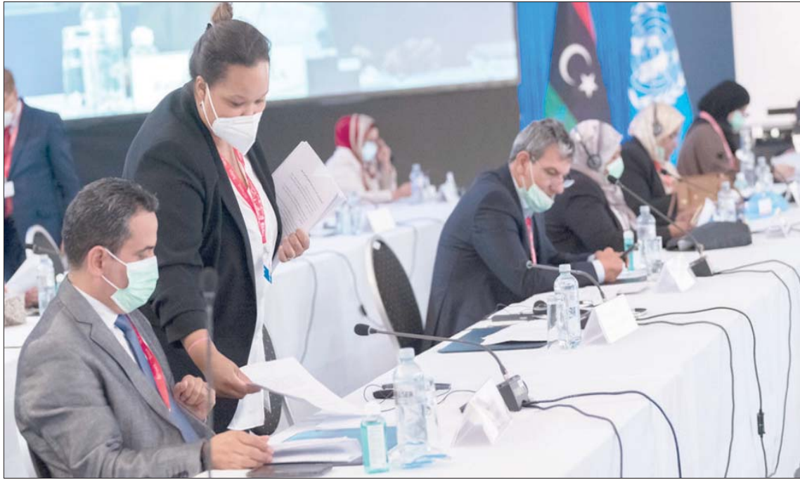
جانب من اجتماعات «ملتقى الحوار الليبي» في جنيف