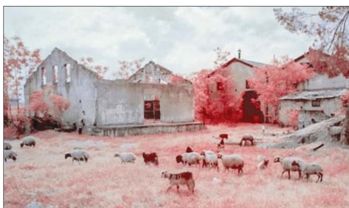
بيروت المحطة الأخيرة» من الأفلام اللبنانية المشاركة في «شاشات الواقع» 2021

أما فيلم «الهبوط» لأين مدينة صيدا الجنوبية أكرم زعتري فيروي قصة ثلاثة رجال يجدون أنفسهم عالمين في الصحراء، الكابلات، وأنابيب الصرف الصحي، والمجارف، وأدوات المطبخ، ومسارح النسخ الكهربائية وصولاً إلى مروحية تهبط في موقع تصوير فيلم زعتري، تلعب كلها مجتمعة دوراً في الفيلم، نظراً لقدراتها الصوتية بدلاً من السردية، ما يخلق انكسارات ومواجهات