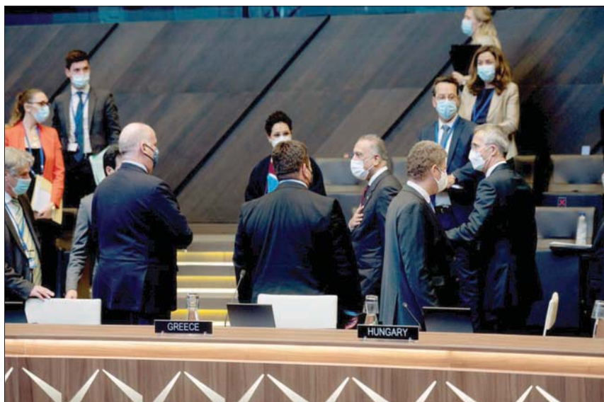
الكاظمي خلال لقائه ممثلي حلف الناتو في بروكسل أول من أمس (تويتر)

التحالف الدولي من العراق. وقال الكاظمي إن «ما أحرزناه من تقدم على الصعيد الأمني، يدفعنا من خلال الحوار الاستراتيجي بين بغداد منذ عام 2020 مع التحالف الدولي إلى إيجاد البات زمنية وفنية لسحب القوات القتالية للتحالف، واستمرار التسليح كل المجالات، خصوصاً التسليح والتأهيل والتدريب والدعم حيث عاد التنسيق بين الجانبين في العديد من الملفات الدولية جيداً في ظل إدارة بايدن بعكس ما كان عليه الأمر أثناء إدارة سلفه دونالد ترمب.