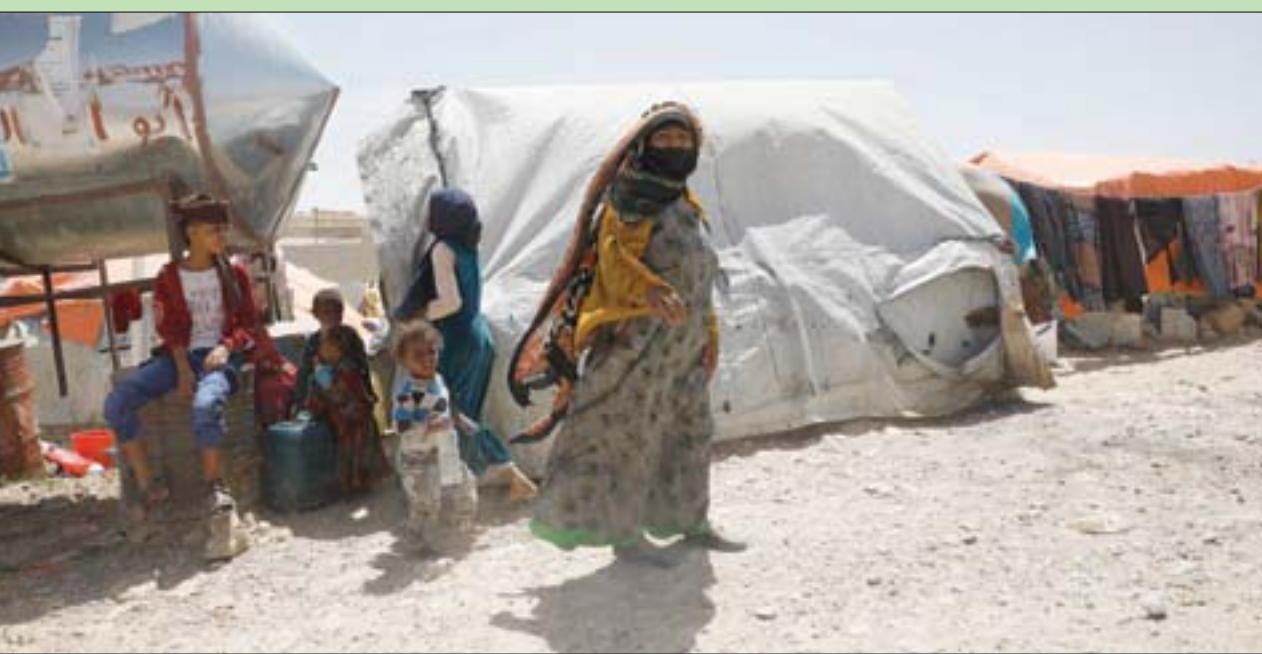
نازحون في مخيم بمحافظة عمران

والتحالفات المشاركة باحتفالات يوم الأغنية اليمنية في موعدها كل بطريقته وأسلوبه، تعزيزاً للثقافة اليمنية وتراتها الأصلية. وفي سياق تعليقه على الموضوع، قال وزير الإعلام اليمني معمر اليرباني «إنه وتفاعلاً مع المبادرة التي أطلقها الفنانون والمثقفون والنشطاء وتعزيزاً للثقافة اليمنية وحماية التراث والفن اليمني، وفي مواجهة الحملة الشرسة التي تشنها الميليشيات ضد الفن، نعلن بوزارة الإعلام والثقافة الأول من يوليو من كل عام يوماً للأغنية اليمنية». وكانت مصادر مقربة من دائرة حكم الجماعة بصنعاء كشفت قبل أيام، لـ «الشرق الأوسط»، عن بدء الميليشيات بتدريب نحو 100 امرأة، ضمن كتيبة أمنية أطلقت عليها «البتول»، لتكون جزءاً من كتائب «الزينية»، (الأمن النسائي للجماعة، حيث تكون مهمتها والإشراف المباشر على ملابس النساء وقمعهن وابتزازهن خلال المناسبات الاجتماعية التي تقام في المنازل وقاعات الأعراس.