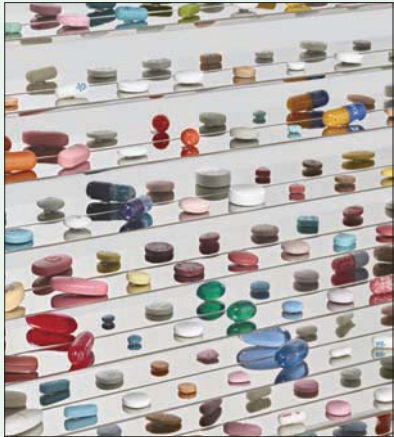
أكبر تجمع لحبوب منع الحمل

تستضيف اثنتان من كبريات مؤسسات العروض التشكيلية في باريس، لوحات الفنان البريطاني داميان هيرست، هذا الصيف. ويقام المعرض الأول في صالة «غاغوسيان» تحت عنوان: «خزانة الحبوب»، والثاني في مؤسسة «كارتييه» بعنوان: «أزهار الكرز». وتبرز أهمية هذا الرسام في أن أعماله الرئيسية تدور حول فكرة الموت وهشاشة الوجود.