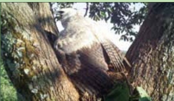
أكبر النسر يعاني من جراء الإزالة الجائرة للغابات

بما فيها البرازيل، وبما وسورينام، فإنه من الصعب إنفاذ تدابير الحماية في المناطق النائية من الغابات. وفي الدراسة، قام الباحثون بقيادة الدكتور إيفرتون ميراندا من جامعة كوازولو ناتال في جنوب أفريقيا، بمراقبة 16 عشاً من أعشاش النسر الخفاف في غابات الأمازون في منطقة «ماتو غروسو» في البرازيل باستخدام الكاميرات.