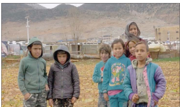
من فيلم «حق الخبزات» للعراقي عباس فاضل ويحكي عن اللاجئين السوريين في لبنان

وفي «بيروت المحطة الأخيرة» لإيلي كمال نستعرض ذكريات طفولية ترتبط ارتباطاً مباشراً بسكة الحديد في بيروت، وبالتحديد في منطقة مار مخايل.