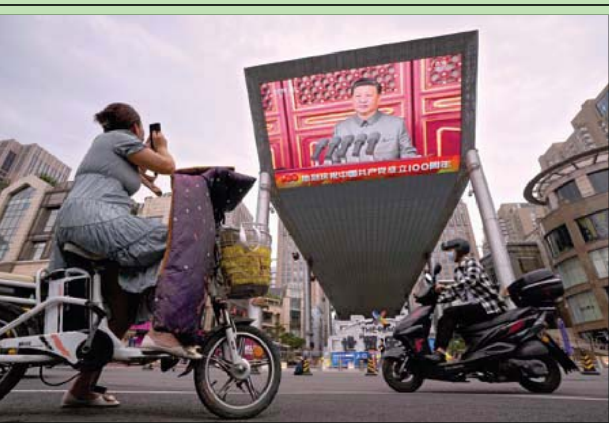
امرأة تسجل بهاتفها خطاب الرئيس الصيني شي جينبينغ بمناسبة الذكرى المئوية لتأسيس الحزب الشيوعي خلال بثه على شاشة في ساحة تيان آنمين ببيكين أمس. وأكد شي أن بلاده حققت هدفها المئوي المتمثل في بناء «مجتمع رغيد الحياة باعتدال» وأنها لن تسمح أبداً لقوى أجنبية بـ«مقعة أو إخضاع» (أب) (تفاصيل ص 11)