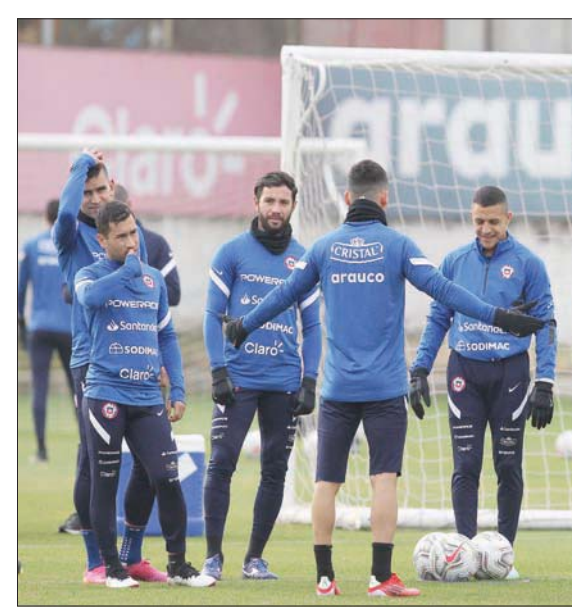
لاعبو تشيلي خلال التدريب استعداداً لموقعة البرازيل الصعبة

البرازيل بكأس القارات عام 2013 وذهبية كولومبيا لمشكلات سياسية في البلاد، والأرجنتين بسبب انتشار وباء «كوفيد 19»، ستصدم اليوم بتشيلي بطله نسختي 2015 و2016 ورابعة النسخة الأخيرة. وتدخل تشيلي المباراة مستفيدة من أسبوع راحة لأنها أعفيت من خوض الجولة الخامسة الأخيرة لدور المجموعات، لأن كل مجموعة تضم 5 منتخبات، فيما لعبت البرازيل الجولة الأخيرة عندما سقطت في فخ التعادل أمام الإكوادور 1 - 1 في غياب نجمها نيمار الذي فضل مديرة تيتي عدم إشراكه خوفاً من حصوله على إندار يحرمه من ربع النهائي.