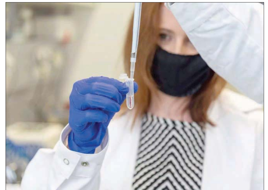
فحص عينة دم (معهد ماكس بلانك لعلوم الضوء)

باستخدام طريقة مبتكرة تسمى «القياس الخلوي للتشوه في الوقت الفعلي» أو ما يعرف اختصارا بـ(RT-DC)، تمكن الباحثون في مركز «ماكس بلانك» للفيزياء والطب في إرلانجن بالمانيا، من إظهار أن «كوفيد - 19» يغير بشكل كبير حجم وصلابة خلايا الدم الحمراء والبيضاء، لفترة تمتد أحيانا على مدى أشهر. وتساعد هذه النتائج في تفسير سبب استمرار شكوى بعض الأشخاص المصابين من الأعراض بعد فترة طويلة من الإصابة بـ«كوفيد - 19». ويعاني بعض المرضى من الآثار طويلة المدى للعدوى الشديدة بالفيروس، حيث يستمر شعورهم بعد 6 أشهر أو أكثر من التعافي بضيق التنفس والتعب والصداع، ولا تزال هذه الحالة التي تسمى بـ«متلازمة ما