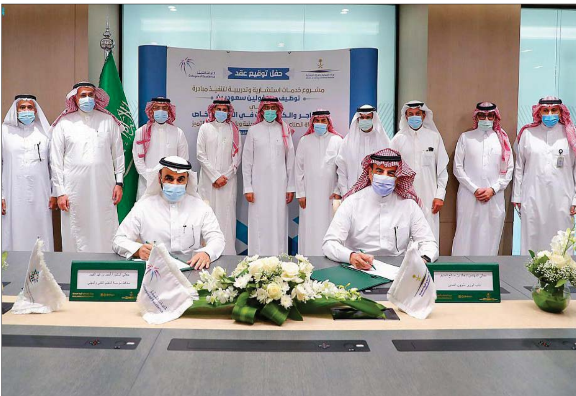
وزارة الصناعة السعودية تبرم اتفاقية تأهيل العاملين السعوديين في قطاع التعدين والمحاجر