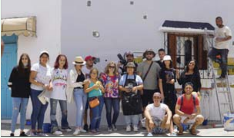
صورة تذكارية للفنانين المشاركين في جداريات «أصيلة 2021»

الإبداع في إطار جداريات أصيلة له طعم خاص، لكون الناس بالمدينة، التي ينضح كل ركن فيها بالفن، معادين على الرسم التشكيلي، سواء كان انطباعياً أو تجريبياً، وذلك بفضل جهود مؤسسة منتدى أصيلة لمنح المدينة روحاً فنية دائمة. واشتغل هذا الفنان، الذي سبق وأبدع جداريات بالدار البيضاء والرباط وأغادير وخريبكة وخارج المغرب، على جدارية بخلفية سوداء، يخطوط ورموز وأرقام بيضاء تجسد وجوهاً بتعبيرات مختلفة، هي ربما أوجه واحاسيس العابرين أمام اللوحة.