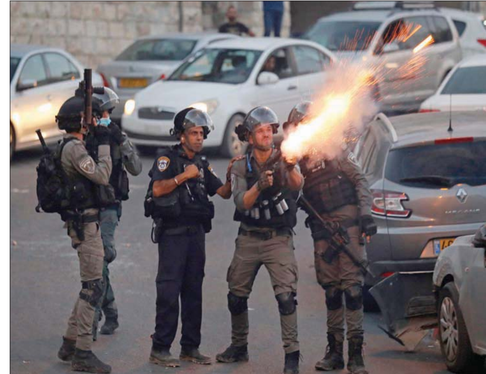
إطلاق الغاز المسيل للدموع ضد مظاهرات فلسطينية حول هدم أبنية في سلوان قرب القدس

انتقوني بليكن، خلال زيارته لإسرائيل، في شهر مايو (أيار) الماضي، وقبل تنصيب الحكومة الإسرائيلية الجديدة، أن الإدارة الأميركية ستعيد فتح القنصلية الأميركية في القدس. وحسب موقع