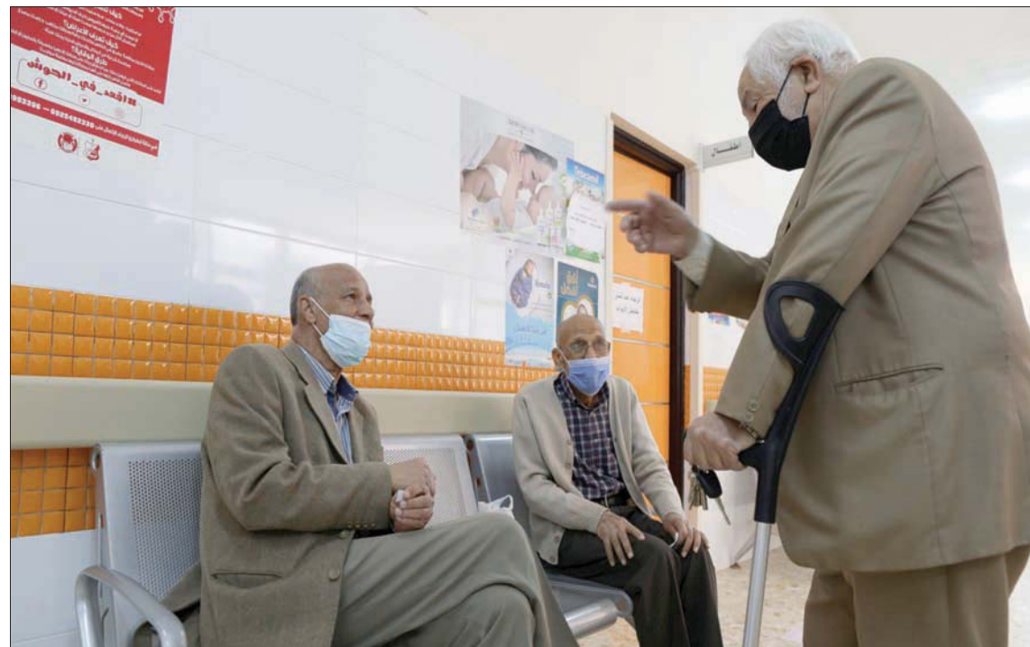
ليبيون ينتظرون الحصول على لقاح «كورونا» في مركز بينغازي أبريل الماضي

الوطني أمس، وجود 431 عينة إيجابية بالفيروس، بينهم 357 جديدة و74 لخاطلة، ليرتفع العدد