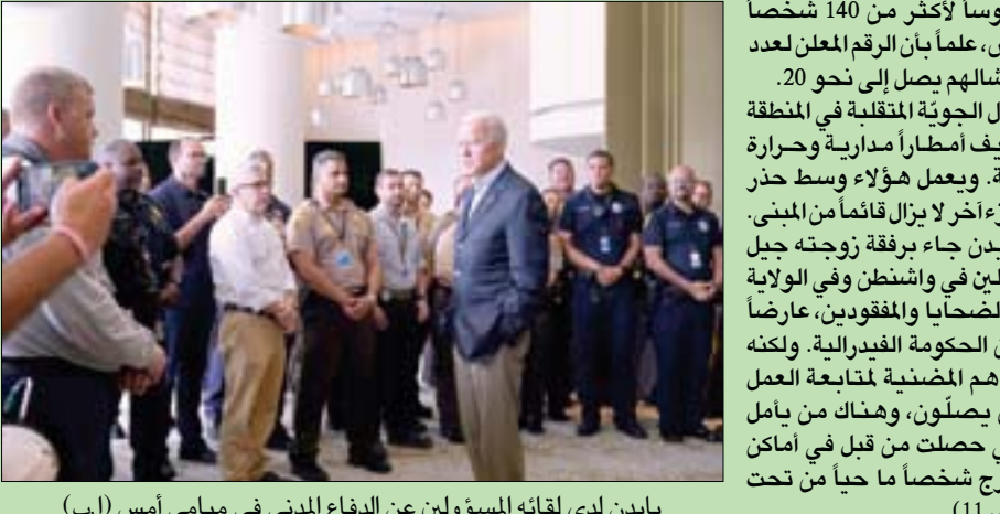
بايدن لدى لقائه المسؤولين عن الدفاع المدني في ميامي أمس