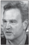
ماركوس آشورث *

لقد تجاوزت عقود من السياسات المضللة في التبت، وشينجيانغ، ومنشوريا، ومنغوليا الداخلية أسوأ حالات القمع العرقي المسجلة في ظل السلالات المتعاقبة، وأنجحت سياسة الطفل الواحد، التي بدأها ماو تسي تونغ، مشاكل قد تستغرق أجيالاً لحلها. لم يحدث للصين أن عقدت مثل المؤتمر العشرين للحزب الشيوعي للاتحاد السوفياتي الذي كشف واستنكر عبادة شخصية ستالين وجرائمه العديدة، ناهيك عن شيء مثل محاكمات نورمبيرغ للكشف عن الجرائم ضد الإنسانية التي ارتكبت في مراحل مختلفة من القرن الماضي. تم حقن الحزب الشيوعي في الصين