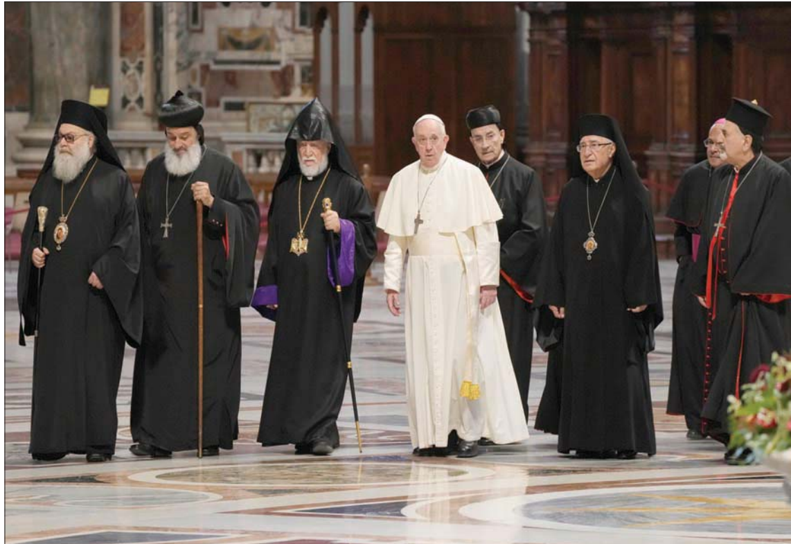
البابا فرنسيس مع رؤساء الطوائف المسيحية اللبنانية في الفاتيكان أمس

وقال البابا، في وقت سابق، إنه يرغب في زيارة لبنان لكنه يريد من الساسة المتناحرين الاتفاق على تشكيل حكومة جديدة. كما أفاد الأسقف بول ريتشارد غالاجر الذي يتولى منصب وزير خارجية دولة الفاتيكان بأن الزيارة «يمكن أن تتم في نهاية 2021 أو مطلع