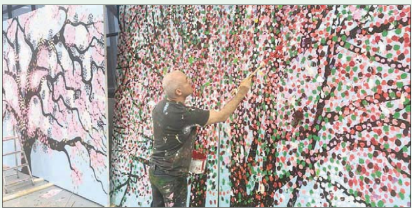
هيرست ولوحات ضخمة تبتلع المتفرج

وإذا كان الجمهور الفرنسي، في العموم، لا يعرف الكثير عن داميان هيرست، فإن هناك من النقاد من يعده النجم الفذ للفن المعاصر. وبعد إغلاق للمتاحف والمعارض بسبب الوباء، تحففي الطوابق الثلاثة لصالة «غاغوسيان» بلوحات الفنان التي تبدو منسجمة مع فكرة الكائنات ذوات العمر القصير والمهددة بالزوال بسبب تقلبات الموسم أو