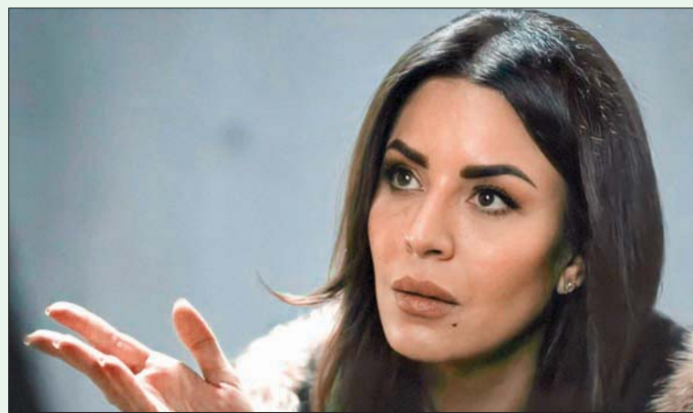
الغناة أمل بوشوشة

بيروت، فاطمة عبد الله صوّرت أمل بوشوشة شخصية «جولي» في «داون تاون» قبل شخصية «هند» الثقيلة في «على صفيح ساخن». خطت الأرض بقدمها في رمضان الفائت، وبلغت درجات الفزادة الدرامية، بكراكتير «هند الحجار»، المتشظية - المتزوجة. تعرض تلفزيون «جؤي» حالياً مسلسل «داون تاون»، حيث تطل بدور مجبول بالمراجمية. لتلقبها «صحية» مملؤنة، «صحية» ماضيها. لا يمكن الاطمئنان إليها أو الثقة بها. ابتسامه أفعى، ونظرات ذب. بوشوشة تلعب بالشخصيات كما يلعب طفل معجونة. تقلبها وتدعكها، وتعيد تشكيلها. تقبض عليها وتتحمك بها. لتلقبها «الشرق الأوسط» لقراءة النجاح وفك أسرار. تستعيد البدايات، وحلمة جمال سليمان التي هزتها. منذ الخطوات الأولى وهي تترك وعورة «لا، أجدد الدوزنة». تشبه التمثيل بالعملية الحسنية: «أمام الكاميرا، أنا الشخصية، وفي المنزل أنا أمل». كل شأن له شأن.