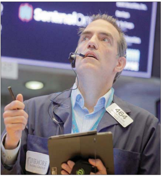
طلغان مخاوف متعلقة باحتمالات ارتفاع بلغ للتضخم العالمي

1,15 نقطة أو ما يعادل 0,03 في المائة إلى 4290,65 نقطة، وتراجع المؤشر ناسداك المجمع 18,48 نقطة أو ما يعادل 0,13 في المائة إلى 14509,85 نقطة.