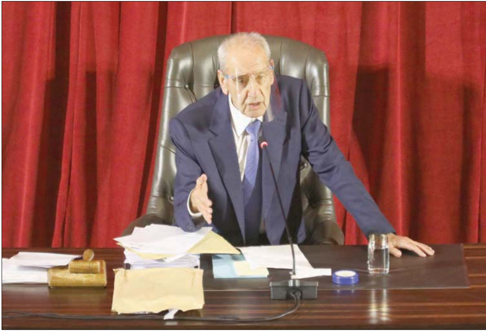
بري مترشحاً لجلسة مجلس النواب أمس

وردد بري على عدوان في موضوع الجلسة: «هل نشرع لدولة ضعيفة تنهب الشعب والمصارف؟»، وهاجم رئيسي الحكومة المستقبل والمكلف بالقول: «هذه المنظومة الحاكمة فيها رئيس حكومة مستقبل (حسان دياب) لا يبذل أي جهد للتخفيف عن الناس، ورئيس حكومة مكلف (سعد الحريري) لا يجتمع مع رئيس الجمهورية». وقال عدوان من مجلس النواب: «لا يمكننا القبول بالاستمرار بنهب أسواق الشعب ولا يمكننا رؤية المسؤولين يتفردون على معاناة الناس ولا يبذلون أي جهد، على الأقل يجب أن يكون هناك ضمير حي للمساءلة»، مؤكداً أن «على البرلمان