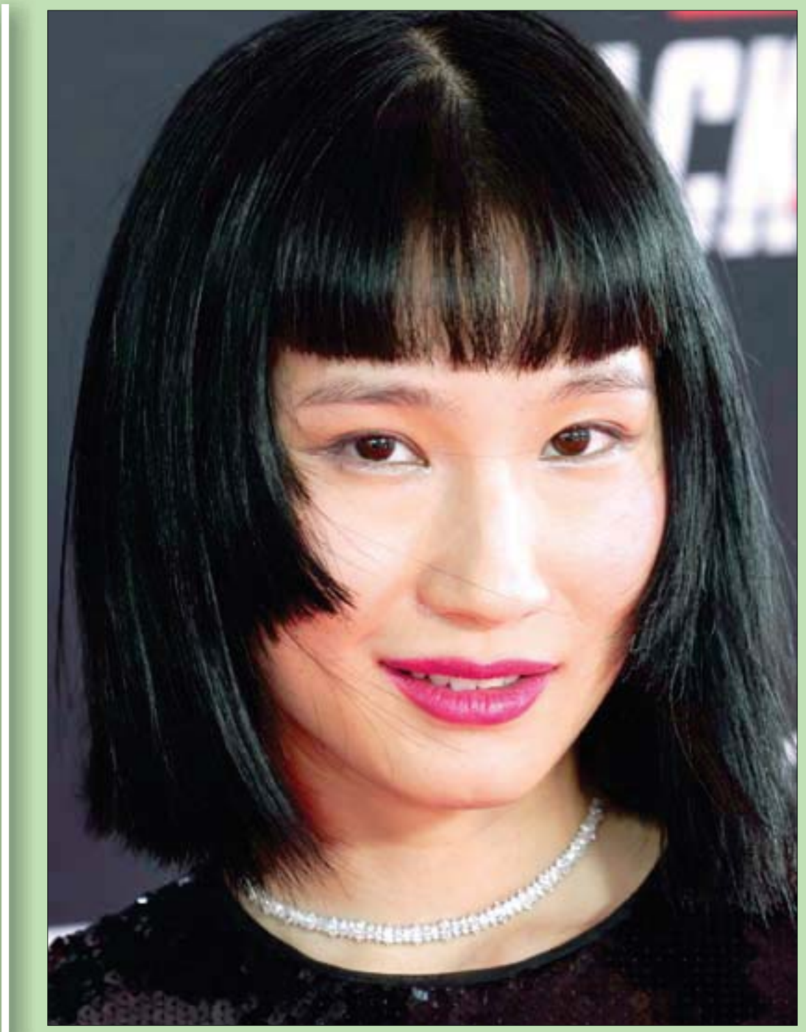
المثلة الصينية منغر تشانغ تقف أمام المصورين لدى حضورها الفيلم الجديد «الأملة السوداء» في لوس أنجلوس