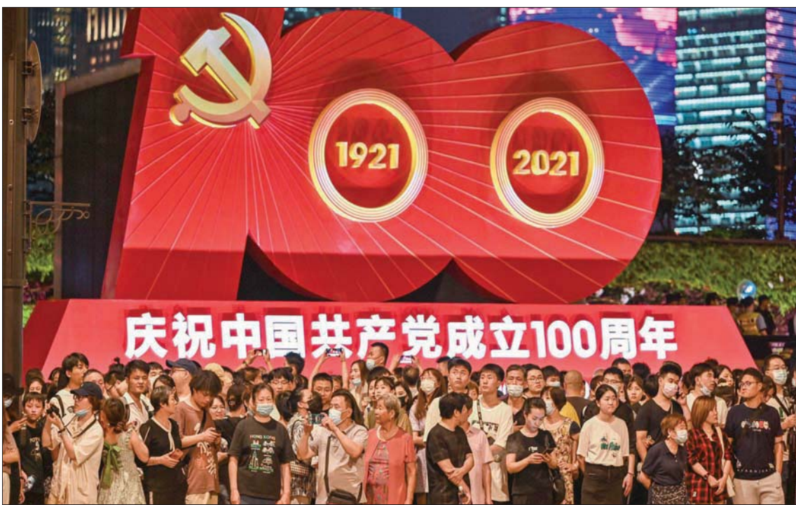
تجمهر الناس أمام يافطة في الذكرى المئوية لتأسيس الحزب (أغب)

عبر أفلام أو مسلسلات متلفزة تجسد رواد الشيوعية. تقحت الرواية التي تدرس اليوم بشكل الحزب. وأدت هذه الحملة إلى رواج «السياحة الحمراء» في أبرز مواقع الثورة الصينية،