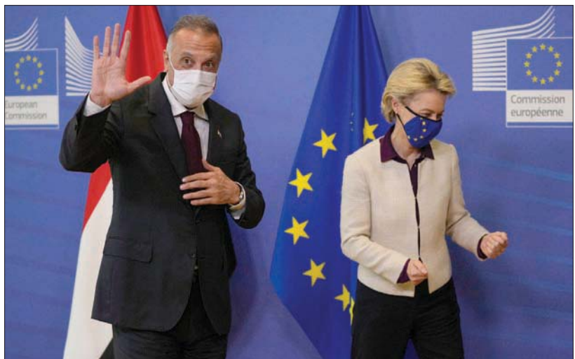
رئيسة المفوضية الأوروبية لدى استقبالها الكاظمي في بروكسل أمس

بغداد، «الشرق الأوسط» بدأ رئيس الوزراء العراقي مصطفى الكاظمي أمس (الأربعاء) زيارة رسمية لمقر الاتحاد الأوروبي في بروكسل، حيث التقى رئيسة المفوضية الأوروبية أورسولا فون دير لاين. وذكر بيان للحكومة العراقية أن الكاظمي سيجري سلسلة لقاءات ومحادثات مع الجانب البلجيكي والاتحاد الأوروبي لتعزيز مستوى التعاون العراقي الأوروبي. وأكد رئيس الوزراء العراقي في تصريح صحفي قبيل مغادرته أول من أمس (الثلاثاء) أن الزيارة ستتركز على تفعيل الاتفاقات التي عقدت بين العراق ودول الاتحاد الأوروبي، وبما يسهم في تجاوز العراق الأزمة الاقتصادية وتوسيع نطاق الاستثمارات. وأضاف أن العراق يواجه نقصاً موسمياً في تجهيز الطاقة الكهربائية تشعُر