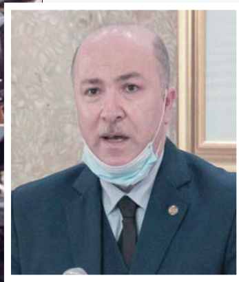
أيمن بن عبد الرحمن الوزير الأول الجديد في الجزائر

واللافت، من خلال هذا التعيين، أن تبون فضل البقاء ضمن التوجه التكنوقراطي لحكومته منذ وصوله إلى الرئاسة نهاية 2019، فيما توقع ملاحظون أن يختار حكومة سياسية تعهد رئاستها شخصية من الأحزاب أو من كتلة المستقلين، الذين تصدروا انتخابات البرلمان الأخيرة، خاصة جبهة التحرير