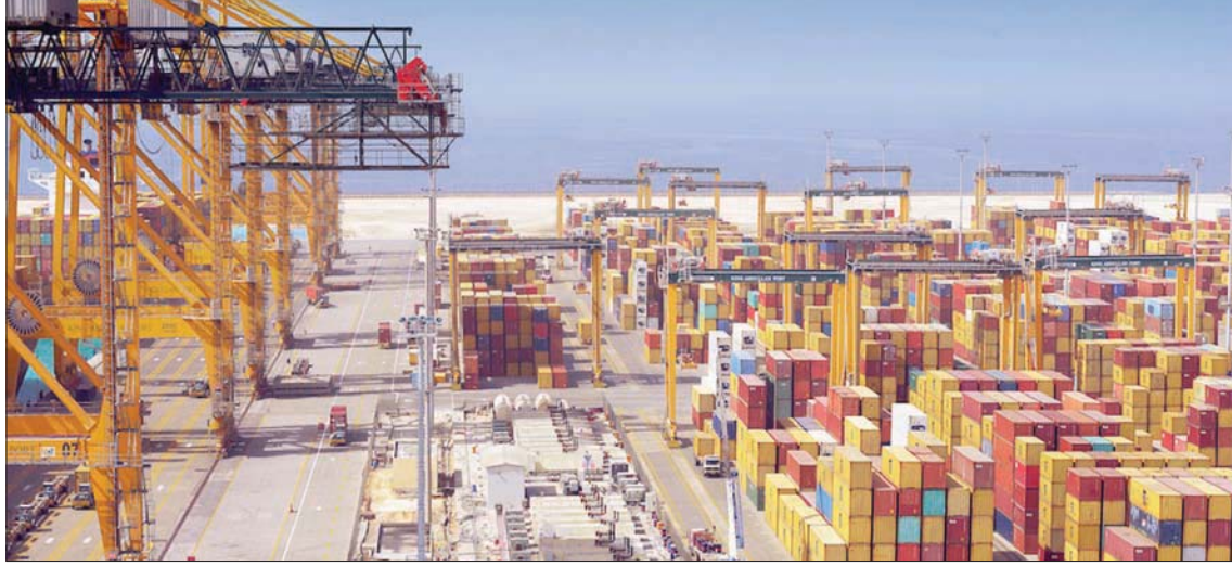
السعودية مرشحة لتكون واحدة من أكبر منصات الخدمات اللوجيستية المهمة في العالم (الشرق الأوسط)

مجموعة من المشروعات الكبرى التي تعزز مكانة المملكة في الخدمات اللوجيستية العالمية، وتطور البنى التحتية، وتخلق مناطق لوجيستية. وبين البوعينين أن من أهدافها الربط البيئي مع دول الخليج بخط سكة حديد، ما يعزز الشبكة اللوجيستية، ويربط دول الخليج اقتصادياً وتنموياً ومجتمعياً، ويعزز الجانب الأمني أيضاً. وشدد على أن ما تتضمنه الاستراتيجية من مشروعات وأهداف سيسهم في تحسين مؤشر الأداء اللوجيستي للمملكة، بما يجعلها ضمن قائمة الدول العشر الأولى عالمياً. ومن جانبه، قال خبير السياسات العامة الدكتور أكرم جدوي لـ«الشرق الأوسط»، إن إطلاق الاستراتيجية الوطنية سيحمل على جذب الاستثمار الأجنبي، نظراً لأهمية قطاع النقل للمستثمر، مما سيعمل على دعم الاقتصاد الوطني، ويحفز ويزيد من القطاعات الأخرى ذات العلاقة والاعتمادية على قطاع النقل والخدمات اللوجيستية، لينتج عن ذلك تنوع كبير في مصادر الدخل، وتوفير لوظائف نوعية. وأوضح الدكتور جدوي أن من إيجابيات الاستراتيجية الجديدة تقوية البنية التحتية لتزيد من قوة الاقتصاد وتنوعه، وكذلك الارتقاء بجودة الحياة في المدن، والمحافظة على البيئة.