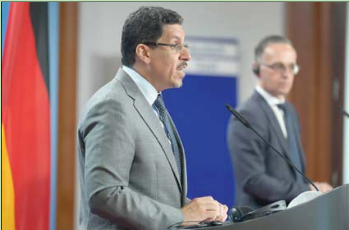
وزيرا الخارجية اليمني والألماني لدى تحدثهما خلال مؤتمر صحافي في برلين أمس

ما زالت تتعامل بشكل غير مسؤول مع هذه القضية وتستمر في عرقلة وصول الفريق الفني الأممي للخران لتقييم وضعه، داعياً إلى تضافر الجهود لوضع حد لملاطمة ميليشيا الحوثي وتلاعيبها بهذا الملف الإنساني والبيئي المهم. من جانبه، أكد وزير الخارجية الألماني هايكو ماس، دعم بلاده لمبادرة السلام الأممية بغناصرها الأربعة، بما يضمن التوصل إلى حل سياسي شامل ينهي الحرب ويحقق السلام والاستقرار في اليمن، وأن بلاده ستعمل مع خلال الاتحاد الأوروبي، وبالتنسيق مع الشركاء الدوليين والأمم المتحدة للدفع بالعملية السياسية، داعياً إيران إلى تغيير دورها بشأن الأزمة اليمنية. وشدد الوزير الألماني - بحسب وكالة الأنباء اليمنية (سبأ) - على ضرورة تسهيل عمل المنظمات الإغاثية وإزالة القيود التي يضعها الحوثيون، لافتاً إلى أن ألمانيا ستعمل خلال المرحلة المقبلة بكل إمكاناتها لدعم اليمن وعملية السلام.