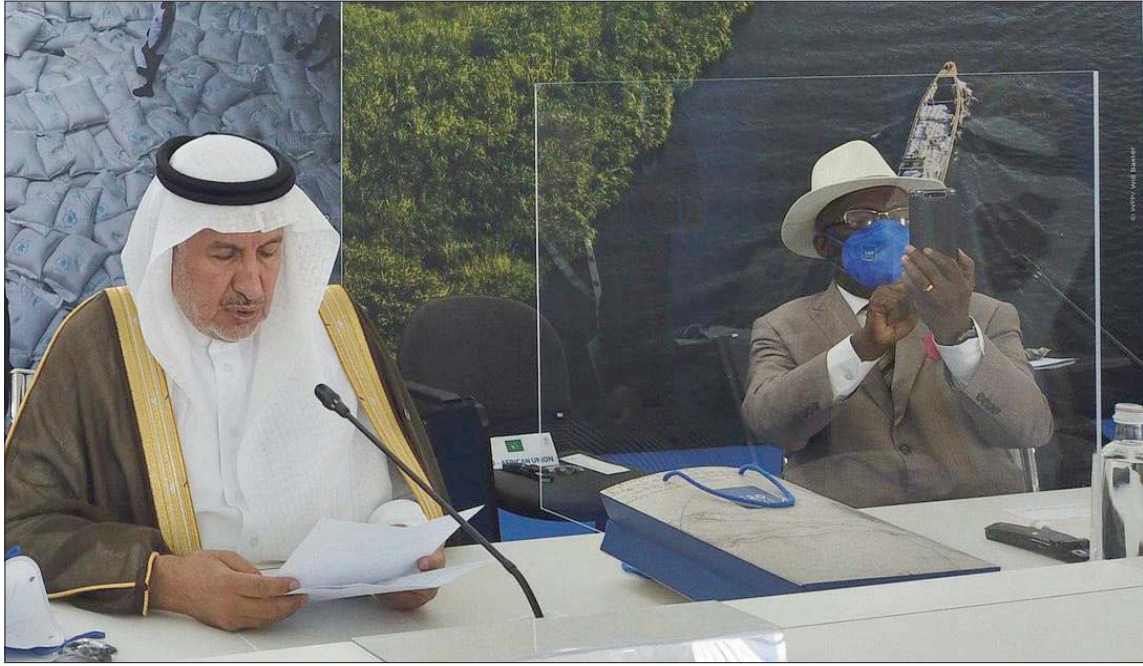
الدكتور عبد الله الربيعية يتحدث خلال الاجتماع الوزاري لمجموعة العشرين في برينديزي الإيطالية

وقال الربيعية، إن التحدي الذي تشكله اجتاحة كورونا «يحث علينا العمل معاً لضمان وجود استجابة عالية منسقة ومنظمة تمكننا من العمل على حماية أكبر عدد ممكن من الأرواح، في ظل ما وصفه بوجود تباين واضح فيما يتعلق بإمدادات اللقاح المضاد لفيروس كورونا، وإن