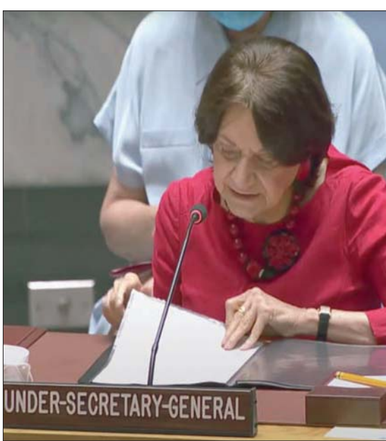
ديكارلو تتحدث حول وضع القرار 2231 في مجلس الأمن أمس

بما في ذلك تلك المتعلقة بالتحقق منها «تتجاوز الحدود النووية ورسدها وتنفيذها للبروتوكول الإضافي. وعبر دولاينتيس عن تنديده بـ«دعم إيران للإرهاب»، لأنه «يبهد القوات الأميركية والموظفين الدبلوماسيين وشركاءنا في المنطقة وأماكن أخرى»، مؤكداً أن الولايات المتحدة «ستواصل استخدام كل الأدوات المتاحة لنا لمواجهة نشاطات إيران المزعزعة للاستقرار في المنطقة، ولتعزيز تنفيذ قرارات مجلس الأمن الأخرى للتصدي لانتشار الأسلحة التقليدية الإيرانية، بما في ذلك حظر القرار 1701