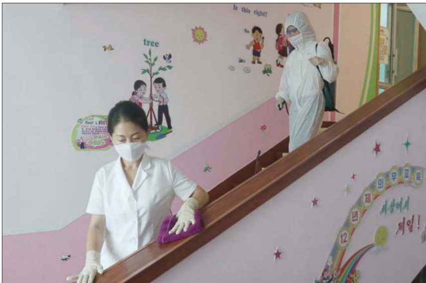
موظفتان تعقمان مدرسة ابتدائية في بيونغ يانغ

الرسمية على إجراءات احتواء فيروس كورونا، بينما حُص المسؤولون المواطنين على القفلة. وخلال عرض عسكري في أكتوبر (تشرين الأول)، شكر كيم الذي دعمت عيناه، الشعب على جهوده، وأشار إلى أن كوريا الشمالية لم تسجل أي إصابة بـ«الفيروس الشيرى»، وهو أمر لطالما شكك محللون بمدى صحته. وكان ثمن دفاعات بيونغ يانغ في وجه كوفيد باهظاً، إذ تركها الحصار المشد الذي فرضته على