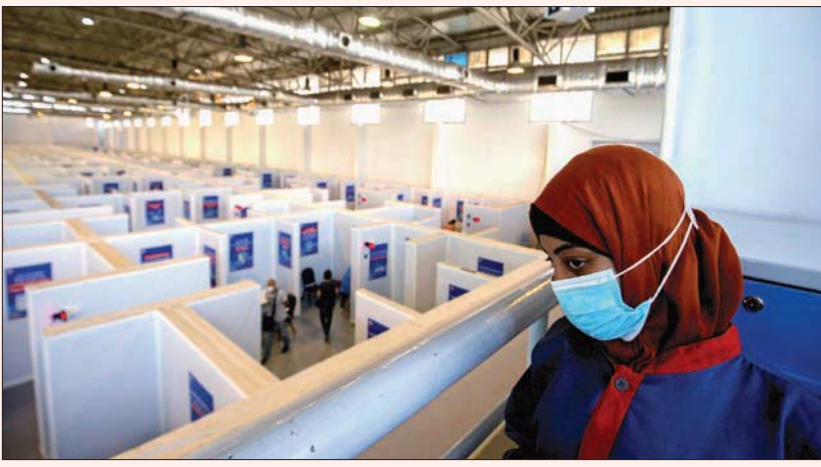
عاملة صحة تستعد لانطلاق حملة التلقيح في القاهرة 5 يونيو

إجمالي المتعافين من الفيروس إلى 210805 أشخاص. ويأتي هذا فيما كشفت وزيرة الصحة المصرية هالة زايد، أمس، عن قيام بلادها بإنتاج 300 ألف جرعة لقاح كورونا (سينوفاك) أغسطس (آب) القادم إنتاج حوالي 10 ملايين جرعة شهرياً لمواجهة فيروس كورونا، واصفة هذه الخطوة بـ«التاريخية». وقالت وزيرة الصحة إن «شركة (سينوفاك) الصينية وافقت على إنتاج مصر حوالي 80 مليون جرعة لقاح كورونا خلال الشهر الستة القادمة»، مشيرة إلى أن مصنع فاكتسيرا بمنطقة العجوزة (الجيزة) يعمل بطاقة إنتاجية في «الشفة الواحد» 300 ألف جرعة