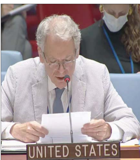
دولانتيس في اجتماع مجلس الأمن أمس

وردت هذه المواقف خلال جلسة عقدها أعضاء مجلس الأمن في شأن الأولى له في عهد بايدين في بيان مشترك على الاتفاق النووي. واستمع أعضاء مجلس الأمن إلى إحاطة من وكيلة الأمين العام للأمم المتحدة للشؤون السياسية وبناء السلام روزماري ديكارلو التي استهلكت كلامها بالإشارة إلى أن الأمين العام أنطونيو غوتيريش لطالما اعتبر أن الخطّة لضمان أمن البرنامج النووي الإيراني سلمي صحراً وأن القرار 2231 «أمر حاسم للهيكل العالمي لعدم الانتشار النووي، والأمن الإقليمي والدولي». واعتبرت أن تنفيذ الخطّة والقرار «تحسن بشكل كبير» منذ الاجتماع الأخير