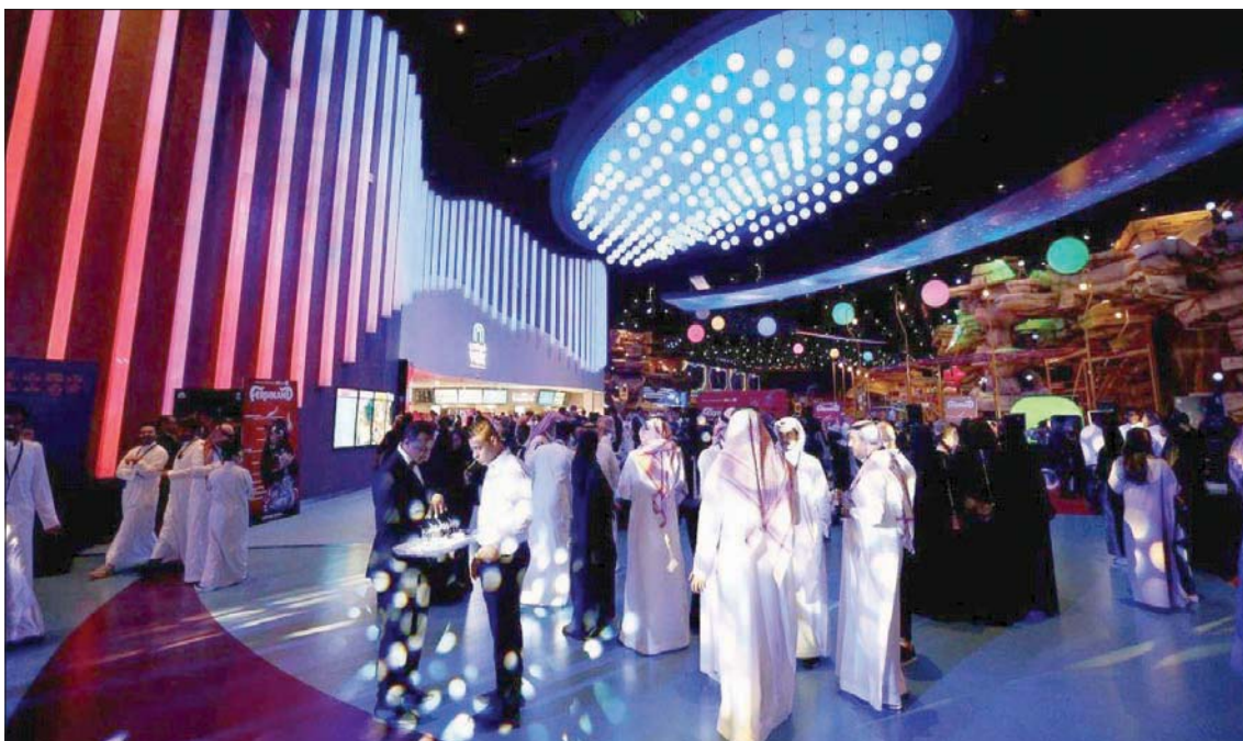
قاعة المهرجان في دار إثراء الثقافية

مثل: الورش، والندوات، والكتب المرئية، والنقاشات المنتظمة. كيف انطلق المهرجان أساساً؟ ومن هو المسؤول الأول عن ولادة الفكرة والعمل عليها؟