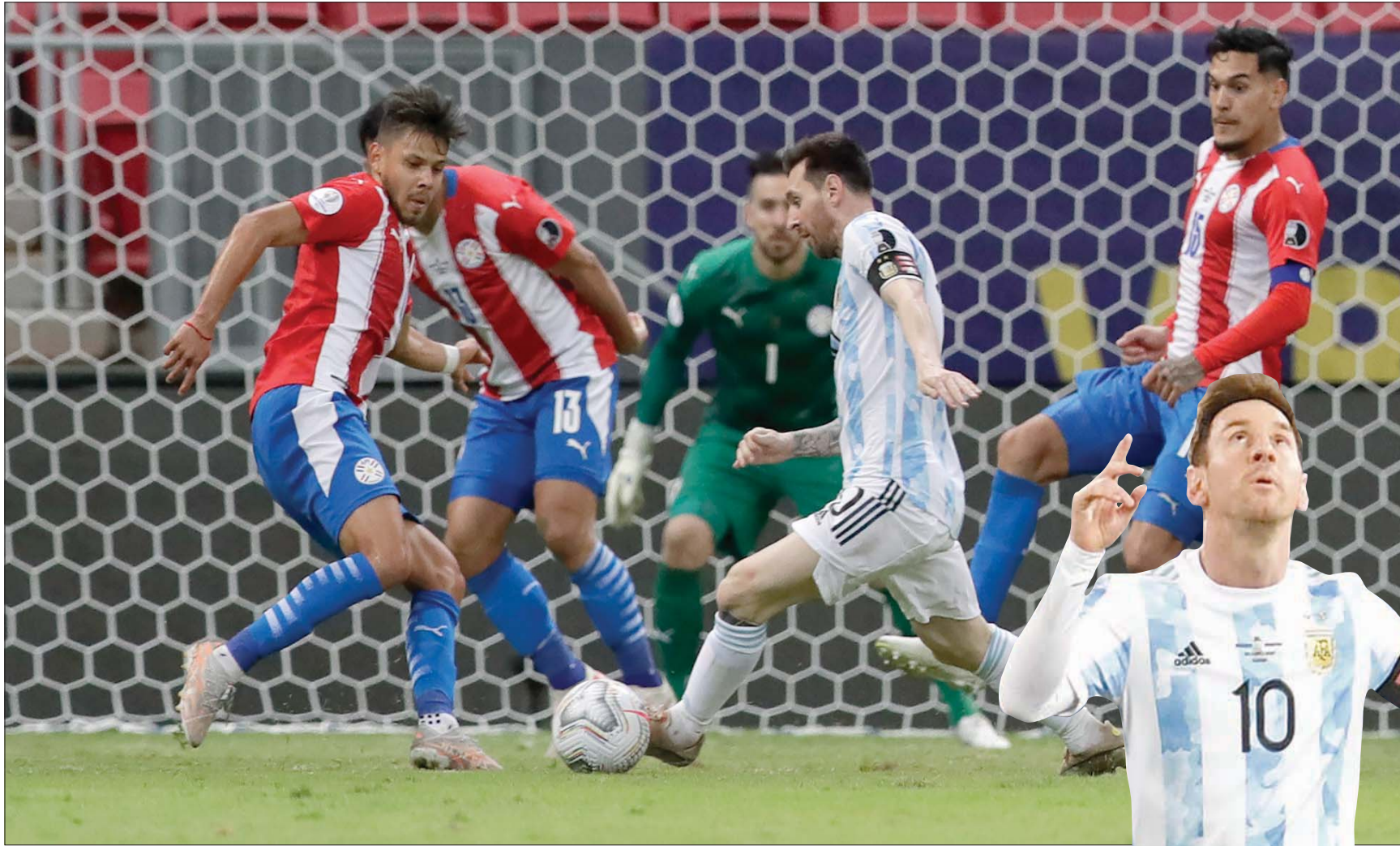
ميسي في مواجهة باراغواي

لا يظهر النجم الأرجنتيني ليونيل ميسي في الكثير من المقابلات الشخصية، وحتى لو ظهر فإنه لا يتحدث كثيرا. لكنه في المقابل يعبر عن نفسه بأفضل طريقة ممكنة داخل المستطيل الأخضر، فإذا مر الكرة بشكل خاطئ فقد يكون ذلك شغلا من أشكال الاحتجاج تجاه مجلس إدارة برشلونة بسبب المواجهة المستمرة بين الطرفين بشأن عقده الجديد مع النادي، وإذا كان يحتفل بأحد أهدافه عن طريق قبضة اليد فقد يكون ذلك تضامنا مع عمال رصيف روساريو المضربين، وهكذا! وفي الفترة الحالية، يقدم ميسي مستويات استثنائية مع منتخب الأرجنتين في نهائيات كأس أميركا الجنوبية (كوبا أميركا). واحتفل بمباراته