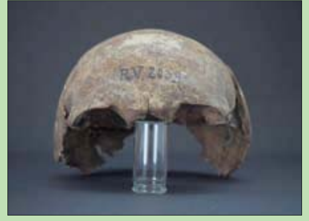
بقايا الصيد التي كشفت عن أقدم سلالة للطاعون (الفريق البحثي)

يمكن أن تثبت الطاعون، ويقدر ما عرفت لم يحدث ذلك في عينات من المملكة القديمة (نحو 5000 قبل اليوم)، ولكن اكتشافاً يتعلق بشخص مات بالطاعون قبل 15 آلاف عام، أقدم إصابة موثقة بنحو 2000 عام مما اقترحه الدراسات السابقة، نافياً أن تكون هناك إصابة أقدم تم تسجيلها في مصر القديمة. ويضيف «على حد علمي، فإنه لا يوجد سوى عدد قليل من الدراسات الجينية من مصر التي