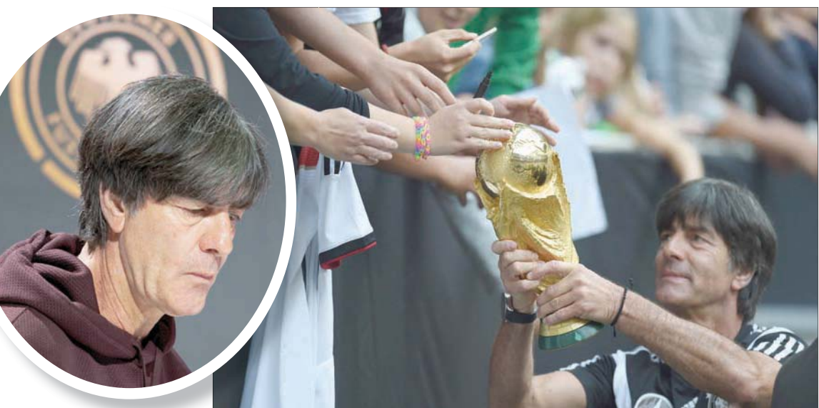
لوف في أسعد لحظاته بطلاً لمونديال 2014

كان مهاجماً عادياً إلى حد ما خلال مسيرته كلاعب، لكنه فتح سجله التدريبي بكناس ألمانيا مع شتوتغارت (1997)، ثم خسر نهائي الكأس الكؤوس الأوروبية (أدمجت لاحقاً مع كأس الاتحاد الأوروبي لتصبح السدوري الأوروبي «يوروبا ليغ» حالياً) في العام التالي. بعد فترة قضاها في فناربعشه التركي، تولى تدريب إنسبروك وقادة للتتويج بطلاً للسدوري النمساوي عام 2002. رشحه يورغن كليزيمان في صيف عام 2004 ليكون مساعده في تدريب منتخب ألمانيا قبل عامين من استضافة بلادهما نهائيات كأس العالم 2006. كانا معاً، وبمساعدة جيل ذهبي يتطلعان لإحداث تغيير تاريخي في فلسفة أسلوب المنتخب الألماني، لكن خططهم فشلت وخرج الفريق من قبل النهائي بخسارته أمام إيطاليا التي توجت في النهاية باللقب كأس أوروبا 2016 ثم بادء هزيل في مونديال 2018 وتوديع من الدور الأول، واكتملت الأمور سواً بالهزيمة من إنجلترا في كأس أوروبا الحالية.