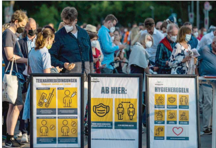
ألمان يصطفون لحضور حفل موسيقي في الهواء الطلق ببرلين

المناطق الأوروبية. ورغم أن هذه الإصابات الجديدة تنتشر بشكل خاص بين الشباب ولا تنذر بموجة وبائية قاسية كالموجات السابقة من حيث خطورة الإصابات والضغط الذي شكلته على المنظومات الصحية في وحدات العناية الفائقة وارتفاع عدد الوفيات، فإن الخبراء يحذرون من أنها بدأت تشكل عبئاً ثقيلاً على أقسام الإسعافات الأولية في المستشفيات التي كانت باشرت استعادة وتيرة الخدمات والعناية التي كانت توفرها للأمراض الأخرى قبل ظهور الوباء.