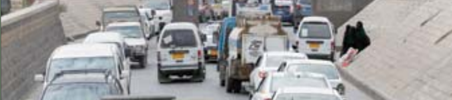
منظر عام لجانب من المدينة القديمة في صنعاء

صنعاء: «الشرق الأوسط» وجه أعضاء سابقون في حكم الانقلاب الحوثي انتقادات حادة للفساد الذي تمارسه الجماعة في مناطق سيطرتها، بما في ذلك الاستيلاء على الممتلكات ومصادرتها وتلقيق تهم التعاون مع الشرعية والتحالف الداعم لها، لتبرير عمليات السطو، كما انتقدوا استبعاد الميليشيات لحلفائهم من الحكم بمن فيهم مجموعة من السياسيين المحذرين من الجنوب. وبينما وصف قيادي سابق فيما تسمى «اللجنة الثورية العليا» سلطة الميليشيات الحوثية بأنها غارقة في الفساد، تعالت الأصوات حتى من داخل الدائرة الضيقة القريبة من زعيم الميليشيات عبد الملك الحوثي، منذرة بسقوط وشيك للجماعة بسبب فساد المسؤولين فيها.