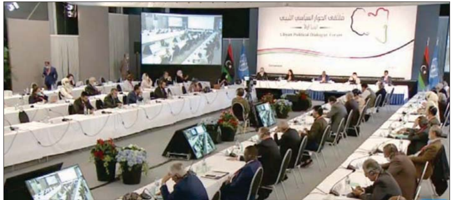
جانب من جلسات اليوم الثاني للحوار السياسي الليبي بجنيف

الوطني لتفعيل «دستور الاستقلال والعودة للملكية الدستورية في ليبيا». إن ملتقى الحوار السياسي «يرسل مؤشرات سلمية واضحة، وأصبح يمثل عقبة أمام وحدة البلاد والمصالحة الوطنية»، وقال لـ«الشرق الأوسط»: «أعضاء الملتقى أتبعوا عدم قدرتهم على إيجاد حل يُبني معاناة الليبيين واستنزاف قدراتهم فلجأوا حساباتهم جيداً لأن الضمانات لا تعد متوفرة وليعلموا أن المفاجآت تكاد تكون قريبة، والنظام الرئاسي الذي اختاروه، بعيداً عن رأي الشعب، سيكون مقدمة لعودة الديكتاتورية أو الحرب الأهلية».