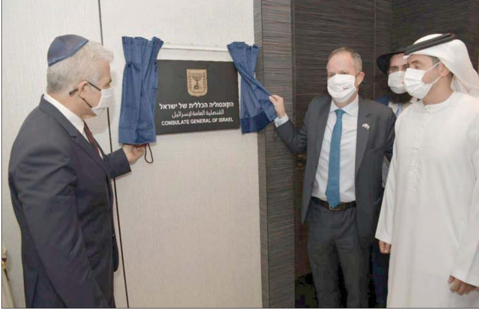
وزير الخارجية الإسرائيلي خلال تدشينه قنصلية بلاده في دبي أمس

وفي تل أبيب، نشر موقع «واللا» مقابلة حصرية مع وزير الخارجية الإماراتي الشيخ عبد الله بن زايد آل نهيان، دعا فيها الإسرائيليين إلى تسوية القضية الفلسطينية. وقال: «التحدي الكبير أمام مسار التطبيع بين إسرائيل والدول العربية هو كيف يتم إدخال الفلسطينيين إلى المعبر. فإن أجلاً أو عاجلاً، يجب حل