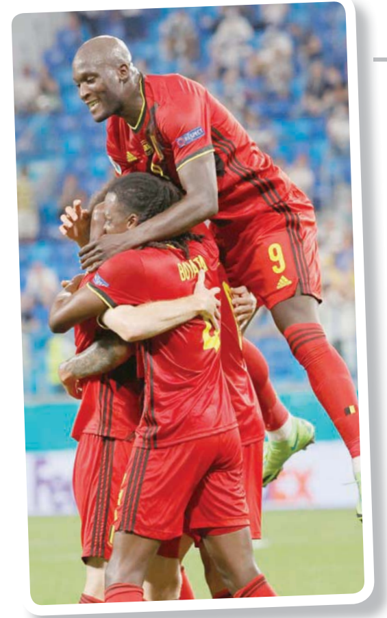
لوكاكو وكتيبة نجوم بلجيكا مرشحون بقوة لحصد اللقب

وأضاف ههداف السدوري الإنجليزي المختار: «أتمنى أن نعود إلى ويمبلي للعب في الدور قبل النهائي، فيما تضع التشبيك التي تغلبت على هولندا أمالها في المهاجم باتريك شيك صاحب 4 أهداف حتى الآن، بفارق هدف عن حامل اللقب البرتغالي كريستيانو رونالدو متصدر ترتيب الهادفين والذي وُعد المنافس أمام بلجيكا في ثمن النهائي. وبرغم عدم توقع هذه المواجهة في ربع النهائي، إلا أنها الوحيدة التي تضم حاملين سابقين للقب، تشيكوسلوفاكيا في 1976 مع نجمها أنتونين باينكا، والدنمارك في 1992 مع الحارس الرمز بيتر شمبايكل، والد الحارس الحالي كاسبر. ويحلم كاسبر بإحراز لقب ثامن في العائلة، لكن عليه أولاً تجاوز تشيكا والسير على خط النهائي».