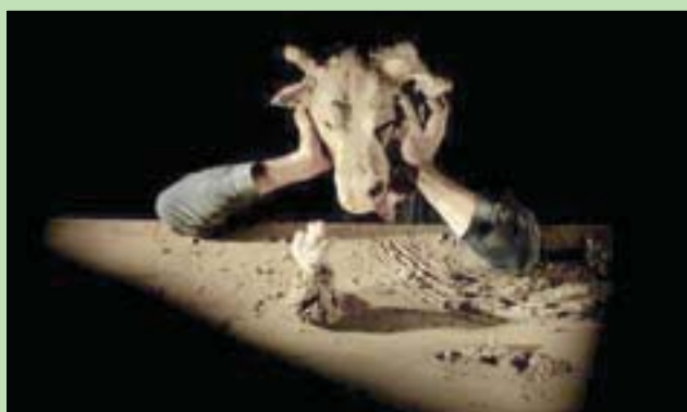
عرض «أصل الكعبة» يمزج بين فن الرواية والرقص وقولية الطين