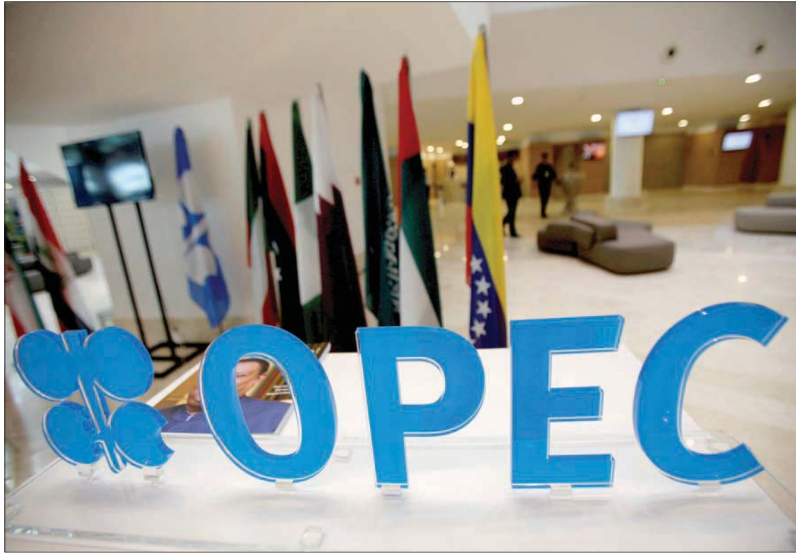
تجتمع الدول الأعضاء في «أوبك بلس» اليوم للنظر في سياسة الإنتاج المستقبلية